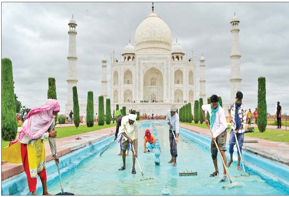
တတ်ဂျီမဟာ အဆောက်အအုံတွင် သန့်ရှင်းရေးပြုလုပ်နေကြစဉ်။

ယင်းသို့လုပ်ဆောင်ခြင်းဖြစ်သည်။ အိန္ဒိယနိုင်ငံ တွင် လူဦးရေ ၁ ဒသမ ၃ ဘီလီယံရှိသည်။ မေလ အတွင်း အိန္ဒိယ၌ ကိုဗစ်-၁၉ ကူးစက်မှုများ အဆ မတန် များပြားခဲ့သည်။ နေ့စဉ်ကူးစက်မှုမှာ ၄၀၀၀၀ ကျော် ရှိခဲ့သည်။ သို့သော် မကြာခင် အချိန်အတွင်းကမှ အိန္ဒိယတွင် နေ့စဉ်ကူးစက်မှုမှာ ၂၀၀၀၀ အောက်သို့ ကျဆင်းလာခဲ့သည်။ ခရီးသွား လုပ်ငန်းမှ တာဝန်ရှိသူများနှင့် ဒေသခံအစိုးရတို့သည် တိုင်းပြည်အတွင်းသို့ ခရီးသွားများကို ပြန်လည် ဝင်ရောက်ခွင့်ပေးရန် အိန္ဒိယအစိုးရထံ တောင်းဆိုခဲ့ ကြသည်။ ခရီးသွားလုပ်ငန်းသည် အိန္ဒိယနိုင်ငံ၏ အဓိကစီးပွားရေးလုပ်ငန်းလည်း ဖြစ်သည်။ တိုင်းပြည်၏ စီးပွားရေး ပြန်လည် သက်သာရာရလာ စေရေးအတွက် နိုင်ငံခြားခရီးသွားများ ပြန်လည် လက်ခံမည့်ရက်ကို အာရုံစိုက်နေကြသည်။ တိုင်းပြည်၏ စီးပွားရေးမှာ ကပ်ရောဂါကြောင့် ထိခိုက်ခဲ့ရသည်။ အင်န်အိတ်ချ်ကေ