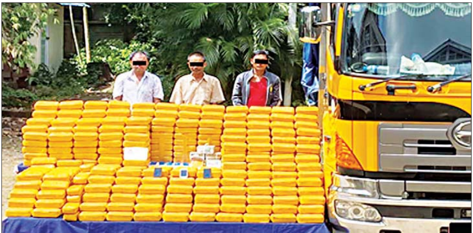
ဇော်ဝင်း၊ ဇေယျာနှင့် မြတ်မိုးတို့ကို သိမ်းဆည်းရမိသည့် စိတ်ကြွေးသွပ်ဆေးပြားများနှင့်အတူ တွေ့ရစဉ်။

နေပြည်တော် အောက်တိုဘာ ၈ ရန်ကုန်တိုင်းဒေသကြီး မင်္ဂလာဒုံမြို့နယ်တွင် ငွေကျပ် ၁၄ ဘီလီယံကျော်တန်ဖိုးရှိ စိတ်ကြွေးသွပ်ဆေးပြား ၉၅ သိန်း ဖမ်းဆီးရမိခဲ့ကြောင်း မြန်မာနိုင်ငံရဲတပ်ဖွဲ့မှ သိရသည်။