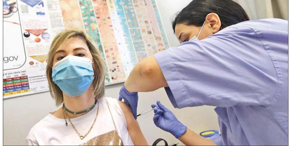
ဘေရွတ်မြို့ဆေးစင်တာတွင် မေ ၂၄ ရက်က ကိုဗစ်-၁၉ ကာကွယ်ဆေး ထိုးပေးနေစဉ်။

ကင်မရွန်းနိုင်ငံ ကျေးရွာတစ်ရွာ၌ ဘိုကိုဟာရမ်တို့၏ တိုက်ခိုက်မှုကြောင့် ရွာသားငါးဦးသေဆုံး ယောင်အွန်ဒေး အောက်တိုဘာ ၈ ကင်မရွန်းနိုင်ငံမြောက်ပိုင်း အစွန်ကျသည့် ကျေးရွာတစ်ရွာ၌ အကြမ်းဖက်အုပ်စုဖြစ်သည့် ဘိုကိုဟာရမ်တို့၏ တိုက်ခိုက်မှုကြောင့် ငါးဦး ထက်မနည်း သေဆုံးခဲ့သည်ဟု လုံခြုံရေးနှင့် ဒေသခံသတင်းအရင်းအမြစ်များက အောက်တို ဘာ ၇ ရက်တွင် ပြောသည်။ အောက်တိုဘာ ၆ ရက်ညပိုင်းမှ အောက်တို ဘာ ၇ ရက် နံနက်ပိုင်း အထိ အင်အားဟာဆီရာ ကျေးရွာ၌ ဘိုကိုဟာရမ်တို့၏ တိုက်ခိုက်မှု ဖြစ်ပွားခဲ့ခြင်းဖြစ်သည်။ ရွာသားများ အိပ်နေစဉ် ကျေးရွာကို ဝင်ရောက်စီးနင်းခဲ့ခြင်းဖြစ်ပြီး ကျေးရွာသားငါးဦးကို သတ်ဖြတ်ခဲ့သည်။ နေအိမ်များနှင့် ဈေးဆိုင်များကိုလည်း ဖျက်ဆီးခဲ့သည်ဟု အဆိုပါဒေသတွင် တာဝန် ချထားခြင်းခံရသည့် တပ်ဖွဲ့ဝင်တစ်ဦးက ဆင်ဟွာသို့ ပြောသည်။ ဆင်ဟွာ