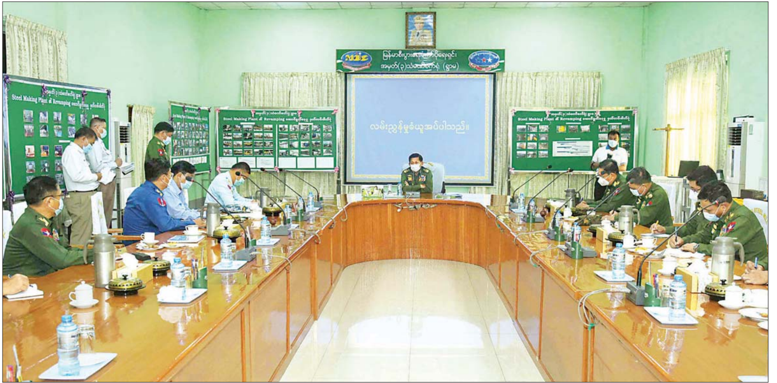
နိုင်ငံတော်စီမံအုပ်ချုပ်ရေးကောင်စီဥက္ကဋ္ဌ၊ နိုင်ငံတော်ဝန်ကြီးချုပ် ဗိုလ်ချုပ်မှူးကြီး မင်းအောင်လှိုင် အား အမှတ် (၃)သံမဏိစက်ရုံ (ရွာမ)အစည်းအဝေးခန်းမတွင် စက်ရုံတာဝန်ရှိသူများက လုပ်ငန်းဆောင်ရွက်နေမှုအခြေအနေများ ရှင်းလင်းတင်ပြစဉ်။

ရှင်းလင်းတင်ပြမှုများအပေါ် နိုင်ငံတော်စီမံအုပ်ချုပ်ရေးကောင်စီဥက္ကဋ္ဌ၊ နိုင်ငံတော်ဝန်ကြီးချုပ်က နိုင်ငံတည်ဆောက်ရာတွင် သံနှင့် သံမဏိထုတ်ကုန်များသည် မရှိမဖြစ် လိုအပ်ပြီး မိမိတို့နိုင်ငံ၌ ကုန်ကြမ်းပစ္စည်းများ ရှိနေသော်လည်း ပြည်တွင်း၌ လုံလောက်စွာ ထုတ်လုပ်နိုင်ခြင်းမရှိသဖြင့် ပြည်ပမှတင်သွင်းနေရကြောင်း၊ နိုင်ငံတွင်း သံမဏိကုန်ကြမ်းအရင်းအမြစ်များအသုံးပြုပြီး ပြည်တွင်းလိုအပ်ချက်ကို ပြည့်မီအောင် ထုတ်လုပ်၍ ပြည်ပမှ တင်သွင်းမှုကို လျှော့ချရန်လိုအပ်ကြောင်း၊ ထုတ်ကုန်များသည် သင့်တင့်သော ဈေးနှုန်းဖြစ်ရန်နှင့် အရည်အသွေးပြည့်မီရန်လိုပြီး ပြည်တွင်းလိုအပ်ချက်ကို ပြည့်မီအောင် ထုတ်လုပ်၍ ပြည်ပသွင်းကုန်လျှော့ချနိုင်ခြင်းဖြင့် နိုင်ငံခြား