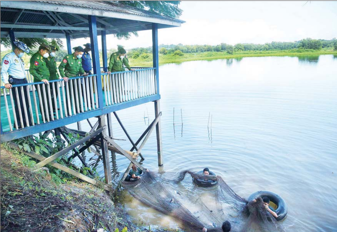
နိုင်ငံတော်စီမံအုပ်ချုပ်ရေးကောင်စီဥက္ကဋ္ဌ၊ တပ်မတော်ကာကွယ်ရေးဦးစီးချုပ် ဗိုလ်ချုပ်မှူးကြီး မင်းအောင်လှိုင် ဘက်စုံ စိုက်ပျိုးမွေးမြူရေးစခန်း(တညင်းကုန်း)၌ ငါးမွေးမြူထားရှိမှုကို ကြည့်ရှုစစ်ဆေးစဉ်။

ရှင်းလင်းတင်ပြမှုများ အပေါ် နိုင်ငံတော် စီမံအုပ်ချုပ်ရေးကောင်စီ ဥက္ကဋ္ဌ၊ တပ်မတော်ကာကွယ်ရေးဦးစီးချုပ် က နေ့စဉ်လူနေမှုဘဝတွင် စားရေးသည် အဓိကကျသောကြောင့် တပ်မတော်အနေ ဖြင့် စိုက်ပျိုးမွေးမြူရေးလုပ်ငန်းများကို အောင်မြင်အောင် အကောင်အထည် ဖော် ဆောင်ရွက်နေခြင်းဖြစ်ကြောင်း၊ တပ်မတော်သားများ၊ မိသားစုဝင်များ၏ သက်သာချောင်ချိရေးကို ဖော်ဆောင်ပေး နိုင်ရမည်ဖြစ်သည့်အပြင် ဒေသတွင်း ကုန်ဈေးနှုန်း တည်ငြိမ်ရေးအတွက်လည်း ပိုလျှံသည့် အသား၊ ငါး၊ ဟင်းသီးဟင်းရွက်၊ စာမျက်နှာ ၅ သို့