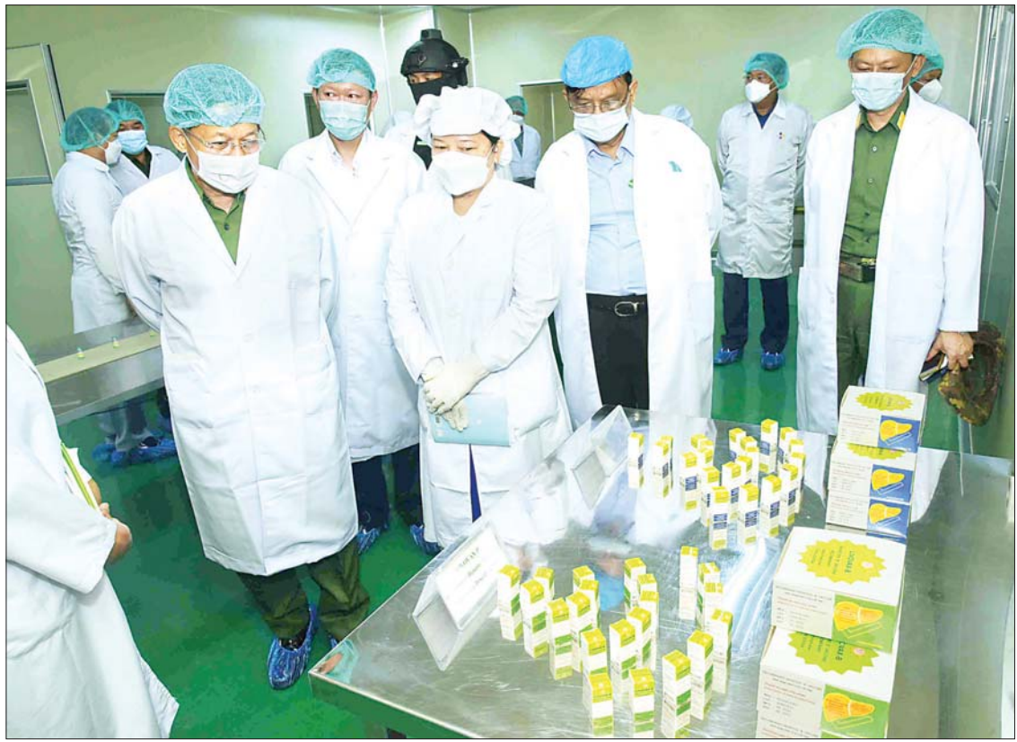
နိုင်ငံတော်စီမံအုပ်ချုပ်ရေးကောင်စီဥက္ကဋ္ဌ၊ နိုင်ငံတော်ဝန်ကြီးချုပ် ဗိုလ်ချုပ်မှူးကြီး မင်းအောင်လှိုင် ဆေးဝါးစက်ရုံခွဲ (ရွာသာကြီး)၌ ဆေးဝါးထုတ်လုပ်မှုအဆင့်ဆင့်ကို ကြည့်ရှုစဉ်။

ရှင်းလင်းတင်ပြမှုများအပေါ် နိုင်ငံတော်စီမံအုပ်ချုပ်ရေးကောင်စီဥက္ကဋ္ဌ၊ နိုင်ငံတော်ဝန်ကြီးချုပ်က ဆေးဝါးထုတ်လုပ်မှုများနှင့် ပတ်သက်၍ ယခင်က ဆိုရှယ်လစ်စီးပွားရေးစနစ်ဖြင့် ဆောင်ရွက်ခဲ့ပြီး ယခုအခါ ဈေးကွက်စီးပွားရေးစနစ်ဖြင့် စီးပွားရေးဆန်ဆန် ဆောင်ရွက်ခဲ့ကြောင်း၊ ဈေးကွက်စီးပွားရေးစနစ် ဖြစ်သော်လည်း ပြည်တွင်းဆေးဝါးလိုအပ်ချက်ကို ဦးစားပေးဆောင်ရွက်ရန်လိုကြောင်း၊ ထုတ်လုပ်သည့် ဆေးပစ္စည်းများ ဈေးကွက်တွင် ယှဉ်ပြိုင်နိုင်ရန်အတွက် ဆေးဝါးများ၏ အရည်အသွေးကောင်းမွန်ရန်နှင့် သင့်တင့်သည့်ဈေးနှုန်းဖြစ်ရန်မှာ အရေးကြီးကြောင်း၊ ပြည်တွင်း ဆေးဝါးထုတ်လုပ်မှုနှင့်ပတ်သက်၍ နိုင်ငံတော်အနေဖြင့် ဖြေလျှော့ပေးမှုများရှိသော်လည်း အခွန်ဆိုင်ရာများနှင့် ပတ်သက်၍ ထိုက်သင့်သည့်ဆောင်ရွက်ချက်များ ပြုလုပ်ရမည်ဖြစ်ကြောင်း၊ ကုန်ပစ္စည်းထုတ်လုပ်ရာတွင် အရည်အသွေးချင်းတူလျှင် ဈေးနှုန်းသက်သာရမည်၊ ဈေးနှုန်းချင်းတူပါက အရည်အသွေး ကောင်းမွန်ရမည်ဖြစ်ကြောင်း၊ ထုတ်လုပ်သူနှင့် သုံးစွဲသူ စာမျက်နှာ ၅ သို့