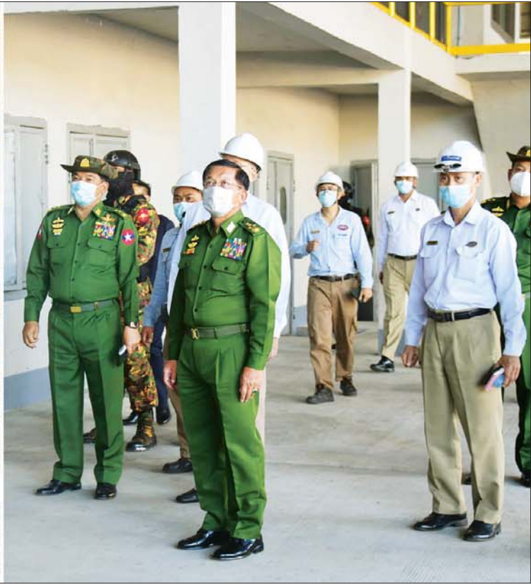
နိုင်ငံတော်စီမံအုပ်ချုပ်ရေးကောင်စီဥက္ကဋ္ဌ၊ နိုင်ငံတော်ဝန်ကြီးချုပ် ဗိုလ်ချုပ်မှူးကြီး မင်းအောင်လှိုင် အင်းစိန်မြို့နယ်ရှိ အမှတ် (၃)သံမဏိစက်ရုံ(ရွာမ) စက်ရုံတွင်းလုပ်ငန်းဆောင်ရွက်နေမှုများကို ကြည့်ရှုစစ်ဆေးစဉ်။

နိုင်ငံတွင်း သံမဏိကုန်ကြမ်းအရင်းအမြစ်များအသုံးပြုပြီး ပြည်တွင်းလိုအပ်ချက်ကို ပြည့်မီအောင်ထုတ်လုပ်၍ ပြည်ပမှတင်သွင်းမှုကို လျှော့ချရန်လိုအပ်