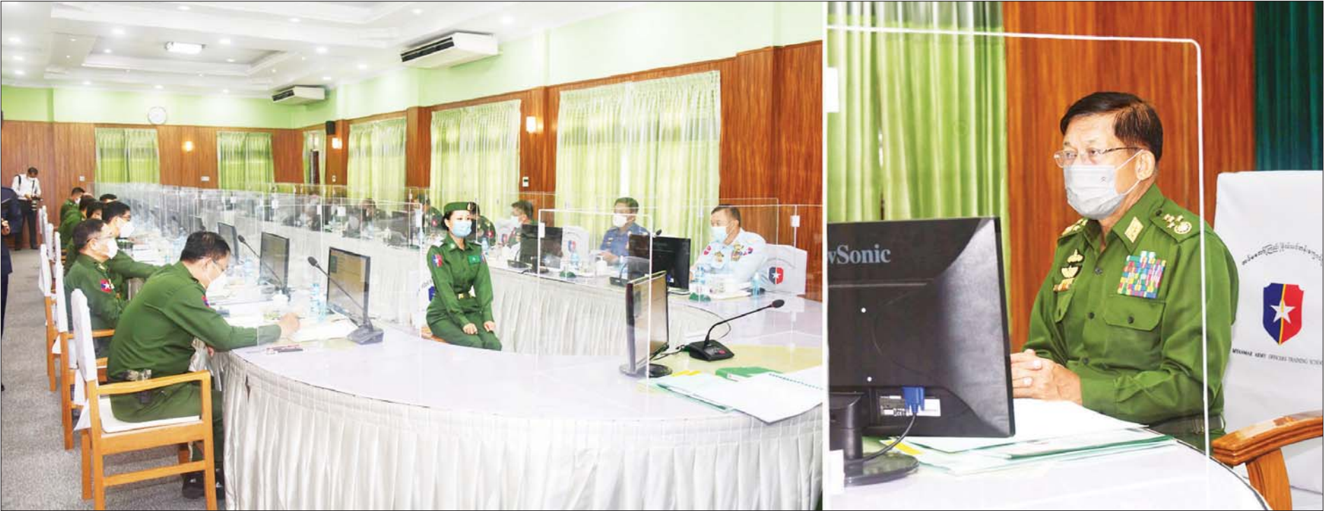
နိုင်ငံတော်စီမံအုပ်ချုပ်ရေးကောင်စီဥက္ကဋ္ဌ၊ တပ်မတော်ကာကွယ်ရေးဦးစီးချုပ် ဗိုလ်ချုပ်မှူးကြီး မင်းအောင်လှိုင် ရန်ကုန်မြို့ မှော်ဘီတပ်နယ်ရှိ တပ်မတော်(ကြည်း) ဗိုလ်သင်တန်းကျောင်း(မှော်ဘီ)၌ ပြုလုပ်သည့် ဘွဲ့ရအမျိုးသမီးဗိုလ်လောင်းသင်တန်း အမှတ်စဉ်(၈) စစ်လက်ရုံးရွေးချယ်ပွဲသို့ တက်ရောက်စိစစ်ရွေးချယ်စဉ်။