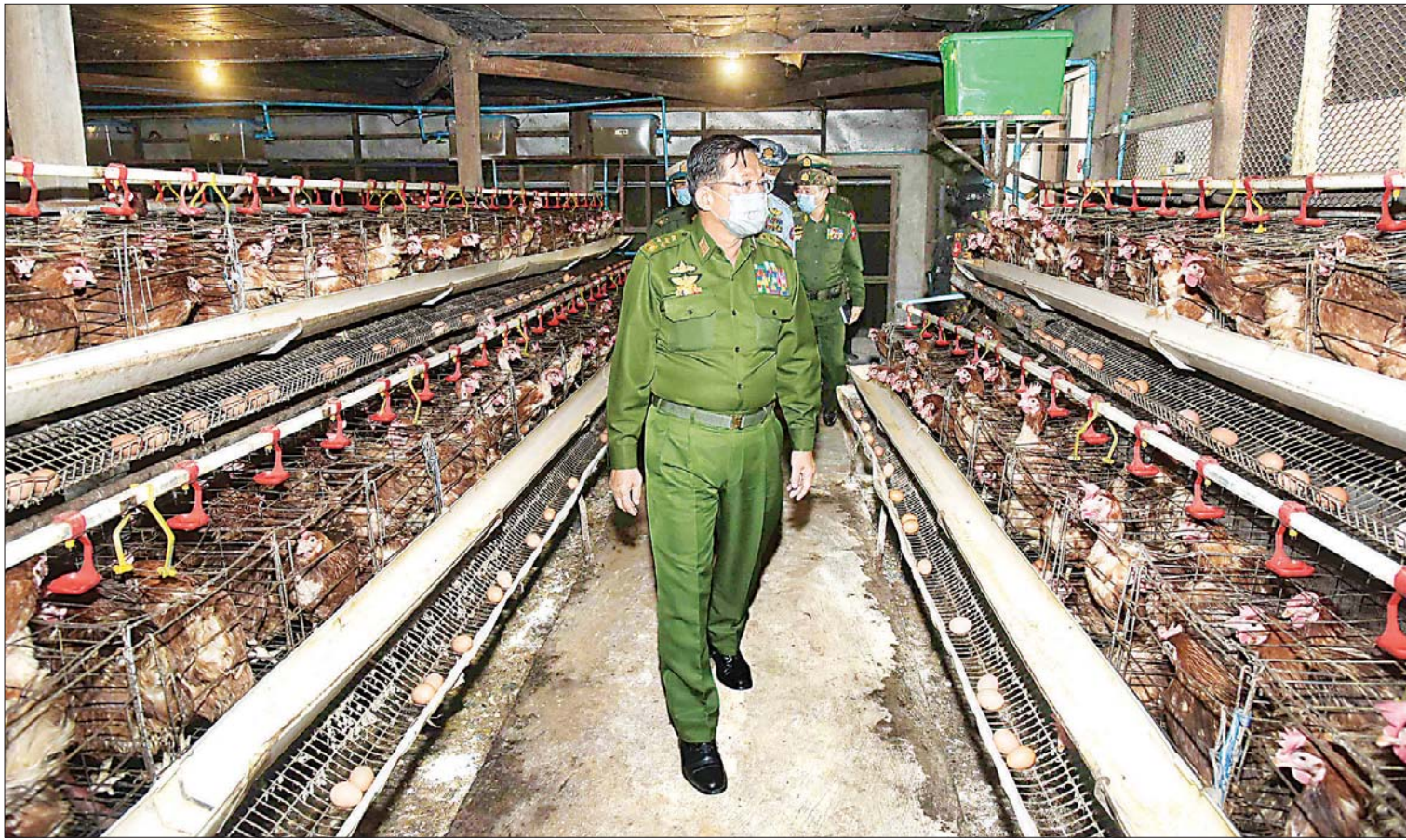
နိုင်ငံတော်စီမံအုပ်ချုပ်ရေးကောင်စီဥက္ကဋ္ဌ၊ တပ်မတော်ကာကွယ်ရေးဦးစီးချုပ် ဗိုလ်ချုပ်မှူးကြီး မင်းအောင်လှိုင် ဘက်စုံစိုက်ပျိုးမွေးမြူရေးစခန်း(တည်းကုန်း)၌ ဥစားကြက်မွေးမြူထားရှိမှုကို ကြည့်ရှုစစ်ဆေးစဉ်။

ဥနှင့် နို့များကို ဒေသခံများ စားရေးအဆင်ပြေစေရန် စဉ်ဆက်မပြတ်ရောင်းချပေးရန် လိုကြောင်း၊ ရန်ကုန်မြို့၏ လူဦးရေသည် ၇ သန်းကျော်ခန့် ရှိပြီး အသား၊ ငါး၊ ဥနှင့် နို့ထွက်ပစ္စည်းလိုအပ်ချက်များကို ဖြည့်ဆည်းပေးနိုင်ရေး ရန်ကုန်တိုင်းဒေသကြီးအတွင်း မွေးမြူရေးဇုန်များကို ဆောင်ရွက်နေခြင်းဖြစ်ကြောင်း၊ ထိုသို့လုပ်ဆောင်ရာတွင် ပုဂ္ဂလိကစိုက်ပျိုးမွေးမြူရေးလုပ်ငန်းများလည်း ရှိသည့်အတွက် ဈေးကွက်လိုအပ်ချက်ကို သိရှိရန်လိုပြီး ဈေးကွက်လိုအပ်ချက်နှင့် ကိုက်ညီသည့် အထွက်နှုန်းကို ထုတ်လုပ်နိုင်ရန် လိုကြောင်း၊ မွေးမြူရေးလုပ်ငန်းများ ဆောင်ရွက်ရာတွင် သမားရိုးကျ မွေးမြူရေးစနစ်များဖြင့် ကျေနပ်နေ၍မရဘဲ မွေးမြူရေးကျွမ်းကျင်သူပညာရှင်များနှင့် ဆွေးနွေးတိုင်ပင်၍ ခေတ်မီနည်းစနစ်ကျနသည့် မွေးမြူရေးလုပ်ငန်းများအဖြစ်သို့ ပြောင်းလဲ လုပ်ဆောင်ရမည်ဖြစ်ကြောင်း၊ ထိုသို့ဆောင်ရွက်ရာတွင် ပထမအဆင့် ဒေသတွင်း စားသုံးမှုလိုအပ်ချက်ကို Target ထား၍ ပြည့်မီအောင် ဆောင်ရွက်ရမည်ဖြစ်ပြီး ထိုမှတစ်ဆင့် အရည်အသွေးကောင်းမွန်သည့် တန်ဖိုးမြင့် ထုတ်ကုန်များ ထုတ်လုပ်ကာ ဝင်ငွေပိုမိုရရှိစေပြီး လူနေမှုအဆင့်မြင့်မားအောင် လုပ်ဆောင်ရမည်ဖြစ်ကြောင်း၊ အခြေခံလူတန်းစားတို့၏ လူနေမှုအဆင့်အတန်းကို မြှင့်တင်ပေးနိုင်ရန် ကုန်ထုတ်လုပ်မှုကို နည်းပညာဖြင့်မြှင့်တင်ပြီး ကျယ်ပြန့်