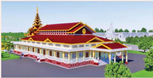
မောရီ(၂၀၃၂၉၀)ပေ ၁ လုံး-၈၇၃၀ သိန်း