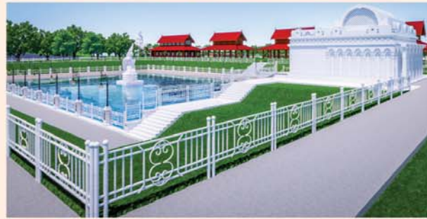
မုဝလိန္ဒတိုင်

၁။ နိုင်ငံတော်စီမံအုပ်ချုပ်ရေးကောင်စီဥက္ကဋ္ဌ၊ တပ်မတော်ကာကွယ်ရေးဦးစီးချုပ် ဗိုလ်ချုပ်မှူးကြီးမင်းအောင်လှိုင် ဦးဆောင်သည့် (၇)ရက်သား၊ သမီး၊ ဘုရားဒါယကာ၊ ဒါယိကာမတို့က မာရဝိဇယပုဒ္ဒရုပ်ပွားတော်မြတ်ကြီးအား မြန်မာနိုင်ငံတွင် ထေရဝါဒပုဒ္ဒသဘာသာတော်ထွန်းလင်းတောက်ပလျက်ရှိသည်ကို ကမ္ဘာကိုပြသရန်၊ တိုင်းပြည်အေးချမ်းသာယာမှုရှိစေရန်၊ ရုပ်ပွားတော်မြတ်ကြီးအား ပြည်တွင်း၊ ပြည်ပဘုရားဖူးများလာရောက်ခြင်းဖြင့် ဒေသတိုးတက်စည်ကားမှုကို အထောက်အကူဖြစ်စေရန်၊ နိုင်ငံတော်ဖွံ့ဖြိုးတိုးတက်မှုအား အထောက်အကူ ဖြစ်စေရန်ရည်သန်လျက် ပြည်ထောင်စုနယ်မြေ နေပြည်တော်၊ ဒက္ခိဏသီရိမြို့နယ်အတွင်း၌ သာသနာတော်ထုံး၊ ရုပ်ပွားဆင်းတုတော်ထုံး၊ မြန်မာ့ရိုးရာတည်ထုံးများနှင့်အညီ တည်ဆောက် ပူဇော်လျက်ရှိပါသည်။