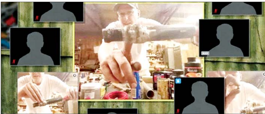
အမေရိကန်နိုင်ငံသားတစ်ဦးက လက်လုပ်ပုံ၊ လက်လုပ်သေနတ်ပြုလုပ်နည်းများနှင့် လူထုအကြား ဖောက်ခွဲမှုလုပ်ရန် နည်းလမ်းများကို Zoom Application မှတစ်ဆင့် သင်ကြားပေးစဉ်။

၂၀၂၁ ခုနှစ် ဖေဖော်ဝါရီလ ၁ ရက်နေ့မှာ နိုင်ငံတော်၏ အရေးပေါ်အခြေအနေ ဖြစ်လာတဲ့အတွက် တပ်မတော်က နိုင်ငံတော်တာဝန်ကို အခြေခံဥပဒေ အရ ထိန်းသိမ်းစောင့်ရှောက်ထားရပါတယ်။ ဒီလို အရေးပေါ်အခြေအနေ ပေါ်ပေါက်လာရတဲ့ အကြောင်းက ၂၀၂၀ ပြည့်နှစ် အထွေထွေရွေးကောက်ပွဲမှာ ဖြစ်ပေါ်ခဲ့တဲ့ မတရားမှုတွေ၊ မဲမသမာမှုတွေကြောင့် ဖြစ်ပါတယ်။ ဒီလိုမတရားမှုတွေ၊ မဲမသမာမှုတွေ ရှိခဲ့ပေမယ့်လည်း ယခင် NLD အစိုးရနဲ့ ရွေးကောက်ပွဲကော်မရှင်အနေနဲ့ ဥပဒေနဲ့အညီ ငြိမ်းချမ်းစွာအဖြေရှာနိုင်တဲ့ အခွင့်အရေးတွေ ရှိခဲ့ပါတယ်။ တပ်မတော်က ထုတ်ပြန်ချက်တွေ အကြိမ်ကြိမ်အခါခါထုတ်ပြီး တောင်းဆိုနေခဲ့တာ ဖြစ်ပါတယ်။ ဖြေရှင်းနိုင်ဖို့ အခွင့်အရေးတွေ၊ အရင်းအမြစ်တွေနဲ့ နည်းလမ်းတွေအားလုံးသည်လည်း NLD အစိုးရနဲ့ တစ်ပါတီကြီးစိုးထားတဲ့ လွှတ်တော်မှာ ရှိနေတာဖြစ်ပါတယ်။ သို့သော်လည်း NLD အစိုးရက လွတ်လပ်စွာရှိနေရမယ့် ရွေးကောက်ပွဲကော်မရှင်ကို လည်း အလုံးစုံချုပ်ကိုင်ထားတဲ့အတွက် ဒီဖြေရှင်းနည်းတွေ၊ အချိန်တွေအားလုံး လက်လွတ်ဆုံးရှုံးခဲ့ရပါတယ်။ ဒါကြောင့်လည်း နိုင်ငံတော်၏အရေးပေါ်အခြေအနေကို ဆိုက်ခဲ့ရတယ်ဆိုပါတော့။