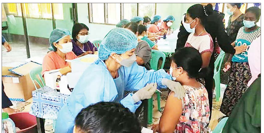
ဆလုံတိုင်းရင်းသားများအား ကိုဗစ်-၁၉ ကာကွယ်ဆေးထိုးနှံပေးစဉ်။