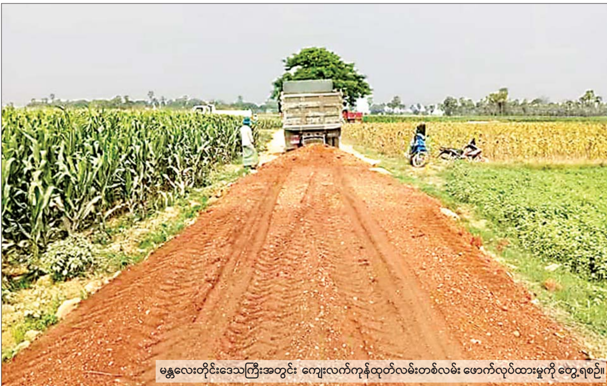
မန္တလေးတိုင်းဒေသကြီးအတွင်း ကျေးလက်ကုန်ထုတ်လမ်းတစ်လမ်း ဖောက်လုပ်ထားမှုကို တွေ့ရစဉ်။