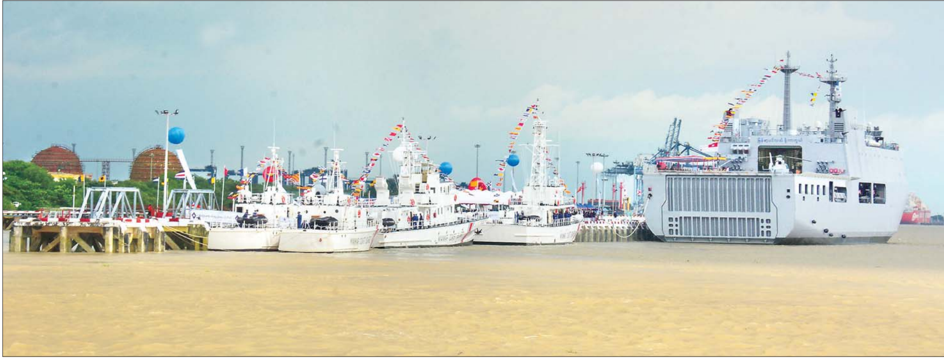
မြန်မာနိုင်ငံ ကမ်းခြေစောင့်တပ်ဖွဲ့ စစ်ရေယာဉ်များကို တွေ့ရစဉ်။