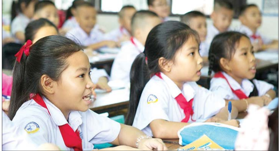
လာအိုနိုင်ငံရှိ စာသင်ကျောင်းတစ်ကျောင်းတွင် ပျော်ရွှင်စွာ စာသင်ကြားနေသည့် ကလေးငယ်များကို တွေ့ရစဉ်။

အရေအတွက် အတော်များများ ကိုသာ ကိုဗစ်-၁၉ ကာကွယ်ဆေး ထိုးပေးနိုင်ခဲ့မည်ဆိုပါက ကျောင်း များ လုံခြုံစိတ်ချရမည်ဖြစ်ပြီး ပြန်လည်ဖွင့်လှစ် ခွင့်ပြုမည်ဖြစ် သည်။ အောက်တိုဘာ ၄ ရက်က ပြုလုပ်ခဲ့သော သတင်းစာ ရှင်းလင်းပွဲတွင် ကျန်းမာရေး ဝန်ကြီးဌာနအောက်ရှိ ကူးစက် ရောဂါ ထိန်းချုပ်ရေးဌာန ညွှန်ကြားရေးမှူးချုပ် ရက်တန် နက်ဆေးဖက်ဆိုဗန်က ပညာရေး ဝန်ကြီးဌာနသည် ကိုဗစ်-၁၉ ကူးစက်ဖြစ်ပွားမှုခံစားနေရသော ကျောင်းသားများနှင့် အိမ်တွင် အွန်လိုင်းသင်ကြားရန် ကြိုးစား နေသည့် ကျောင်းသားများ အကြောင်း သတင်းအချက် အလက်များ ကောက်ယူရန်