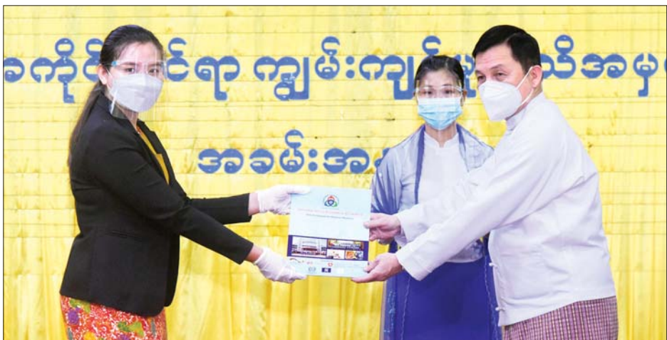
ပြည်ထောင်စုဝန်ကြီး ဦးမြင့်ကြိုင် ကျွမ်းကျင်မှုအသိအမှတ်ပြုလက်မှတ်များကို ကျွမ်းကျင်လုပ်သားများကိုယ်စား ကိုယ်စားလှယ်တစ်ဦးထံ ပေးအပ်စဉ်။

တိုဘာလမှ ၂၀၂၂ ခုနှစ် မတ်လအထိ လုပ်သား ၄၂၄၅ ဦးကို ကျန်းမာရေးဝန်ကြီးဌာန၏ လမ်းညွှန်ချက်နှင့်အညီ စစ်ဆေးအကဲဖြတ်ရန် လျာထားသတ်မှတ်ထားပြီး ဖြစ်ကြောင်း။