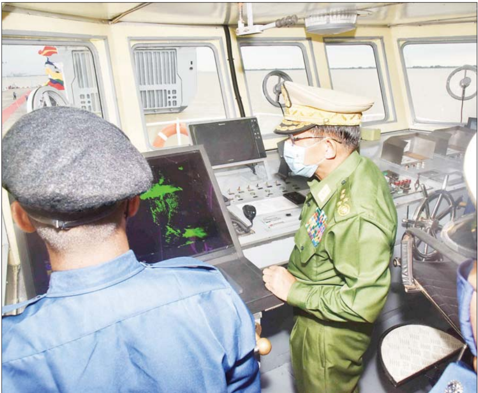
နိုင်ငံတော်စီမံအုပ်ချုပ်ရေးကောင်စီဥက္ကဋ္ဌ၊ တပ်မတော်ကာကွယ်ရေးဦးစီးချုပ် ဗိုလ်ချုပ်မှူးကြီး မင်းအောင်လှိုင် ကမ်းခြေစောင့်တပ်ဖွဲ့သို့ လွှဲပြောင်းပေးအပ်ခဲ့သည့် ရေယာဉ်အတွင်း ကြည့်ရှုစဉ်။

❖ ကမ်းရိုးတန်းတစ်လျှောက်၌ အလားအလာကောင်းသည့် ရေနက်ဆိပ်ကမ်းများရှိပြီး နိုင်ငံတကာကုန်သွယ်ရေး ရေလမ်းကြောင်းများ ဖြတ်သန်းလျက်ရှိ ❖ ထို့ကြောင့် မိမိတို့ရေပြင်နှင့် ဆက်စပ်ပင်လယ်ပြင်တွင် ရှိသည့် ပင်လယ်ပြင် ဆက်သွယ်ရေးလမ်းကြောင်း (Sea Line of Communication) လုံခြုံရေးနှင့် မိမိတို့ ရေနက်ဆိပ်ကမ်းများ ဘေးကင်းလုံခြုံရေးကို ဆောင်ရွက်ပေးကြရမည်