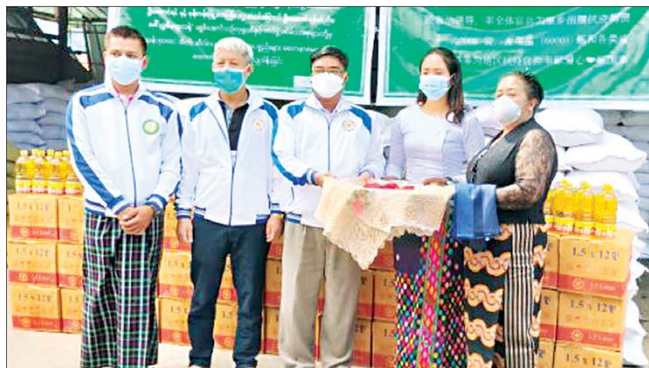
စားဝတ်နေရေး အခက်ပြေစေရန် အတွက် အခြေခံလူတန်းစားများ၊ ဌာနဆိုင်ရာဝန်ထမ်းများ၊ ဘာသာရေးကျောင်းများ၊ လူမှုရေးအသင်းအဖွဲ့များ၊ တပ်ရင်းတပ်ဖွဲ့ဝင်များထံသို့ အိမ်ထောင်စုတစ်စုလျှင် ဆန် ၁၂ ပြည်ပါ တစ်အိတ်နှင့် ဆီတစ်ပိဿာ၊ စုစုပေါင်း ဆန် ၅၀၀၀ အိတ်နှင့် ဆီပိဿာ ၆၀၀၀ တန်ဖိုး ငွေကျပ်သိန်း ၁၂၅၀ နှင့် တာမိုးညွဲမြို့အတွက် လိုအပ်သည့် နေရာတွင်အသုံးပြုရန်ငွေကျပ်သိန်း ၁၉၀ တန်ဖိုးရှိ လူနာတင်ယာဉ် တစ်စီးကို ဖြူစင်မေတ္တာ နာရေးကူညီမှုအသင်းသို့ ပေးအပ်လှူဒါန်းကြောင်း သိရသည်။ (အပေါ်ပုံ) အဆိုပါ အခမ်းအနားသို့ မြို့အထွေထွေ အုပ်ချုပ်ရေးမှူး ဦးထွန်းနိုင်နှင့် ဌာနဆိုင်ရာတာဝန်ရှိသူများ၊ တာမိုးညွဲမြို့ မန်ဂျယ် ပြည်သူ့စစ်(ဌာန)မှ တပ်ဖွဲ့ဝင်များ၊ အလှူရှင်နှင့် ဒေသခံများ တက်ရောက်ကြောင်း သိရသည်။ အယ်လ်စိုး(မူဆယ်)

တာမိုးညွဲ အောက်တိုဘာ ၆ ရှမ်းပြည်နယ် (မြောက်ပိုင်း) မူဆယ်ခရိုင် တာမိုးညွဲမြို့မနယ်မြေ ပြည်သူ့စစ်(ဌာန) ရုံးဝင်း၌ ယနေ့နံနက် ၁၀ နာရီက ကိုဗစ်-၁၉ ရောဂါဖြစ်ပွားနေသည့်ကာလ အတွင်း အခက်အခဲကြုံတွေ့နေရသော ပြည်သူများအတွက် အရှေ့မြောက်တိုင်းစစ်ဌာနချုပ် မန်ဂျယ်ပြည်သူ့စစ်(ဌာန) အဖွဲ့ ခေါင်းဆောင် ဦးအောင်ရင်နှင့် ရွှေဖီအောင်ယဉ် ကုမ္ပဏီမီသားစု တို့က ငွေကျပ်သိန်း ၁၂၅၀ တန်ဖိုး ရှိသော စားသုံးကုန်ပစ္စည်းများနှင့် ငွေကျပ်သိန်း ၁၉၀ တန်ဖိုးရှိ မော်တော်ယာဉ်ထောက်ပံ့လှူဒါန်းပေးအပ်ခြင်း အခမ်းအနားကို ကျင်းပသည်။ ထိုသို့ စားသောက်ကုန်များ လှူဒါန်းရာတွင် အခက်အခဲကြုံတွေ့နေရသော ပြည်သူများ