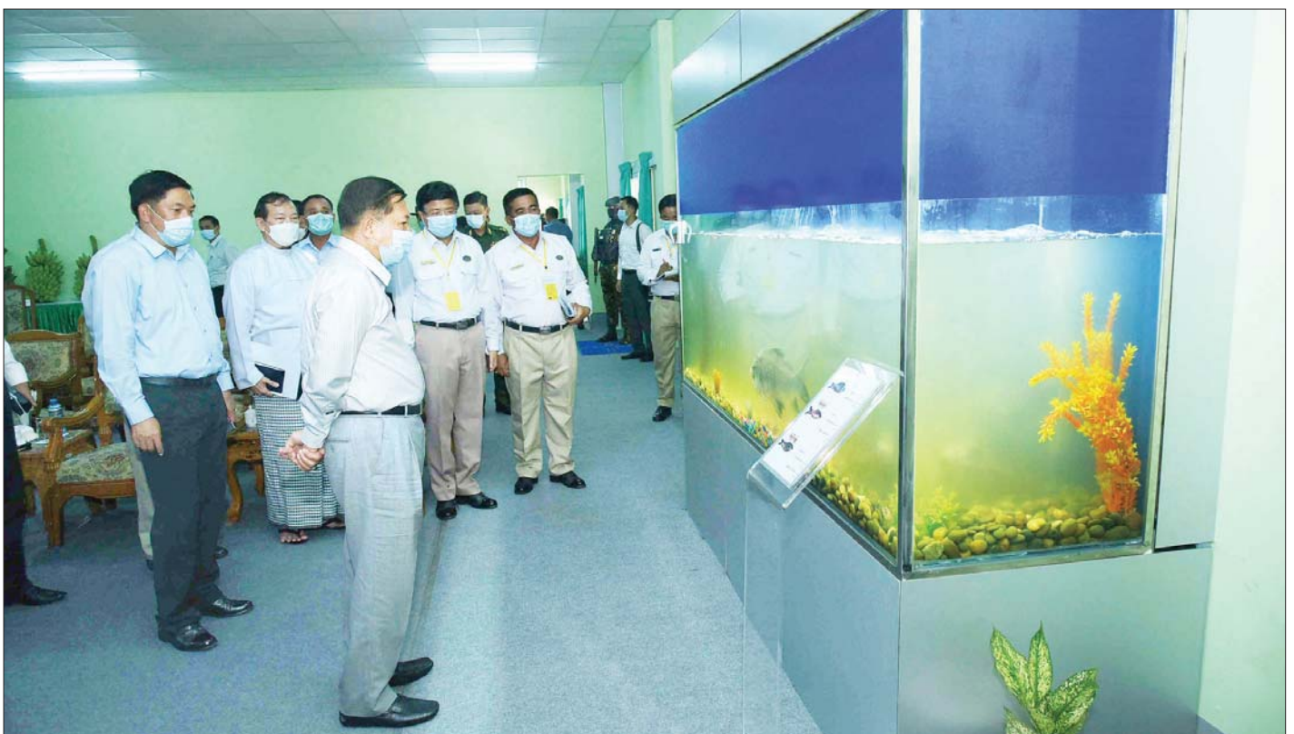
နိုင်ငံတော်စီမံအုပ်ချုပ်ရေးကောင်စီဥက္ကဋ္ဌ၊ နိုင်ငံတော်ဝန်ကြီးချုပ် ဗိုလ်ချုပ်မှူးကြီး မင်းအောင်လှိုင် သီလဝါဘက်စုံစိုက်ပျိုးမွေးမြူရေးဇုန်တွင် မွေးမြူထားရှိသည့် ငါးအမျိုးအစားနမူနာ ပြသထားရှိမှုကို ကြည့်ရှုစစ်ဆေးစဉ်။

ဦးစွာ နိုင်ငံတော်စီမံအုပ်ချုပ်ရေးကောင်စီ ဥက္ကဋ္ဌ၊ နိုင်ငံတော်ဝန်ကြီးချုပ် အား မွေးမြူရေးဇုန်ရှင်းလင်းဆောင်၌ မြန်မာစီးပွားရေးကော်ပိုရေးရှင်း ဥက္ကဋ္ဌ ဒုတိယဗိုလ်ချုပ်ကြီး ညိုစော၊ မြန်မာစီးပွားရေးဦးပိုင်အများနှင့်သက်ဆိုင်သော ကုမ္ပဏီလီမိတက် ဥက္ကဋ္ဌ ဒုတိယဗိုလ်ချုပ်ကြီး ဆန်းဦးနှင့် တာဝန်ရှိသူများက သီလဝါ ဘက်စုံစိုက်ပျိုးမွေးမြူရေးဇုန်၊ ၂၆ မိုင် ဘက်စုံစိုက်ပျိုးမွေးမြူရေးဇုန်နှင့် တွဲတေးမြို့နယ်ရှိ ရွှေမုယင်းငါးကန်တို့၏ လုပ်ငန်းဆောင်ရွက်နေမှု အခြေအနေများ၊ ဘက်စုံ စိုက်ပျိုးမွေးမြူရေးဇုန်များ အကောင်အထည်ဖော်ဆောင်ရွက်ခြင်းနှင့် ဆောင်ရွက်ပြီးစီးပြီး လုပ်ငန်းလည်ပတ်နေမှု အခြေအနေများ၊