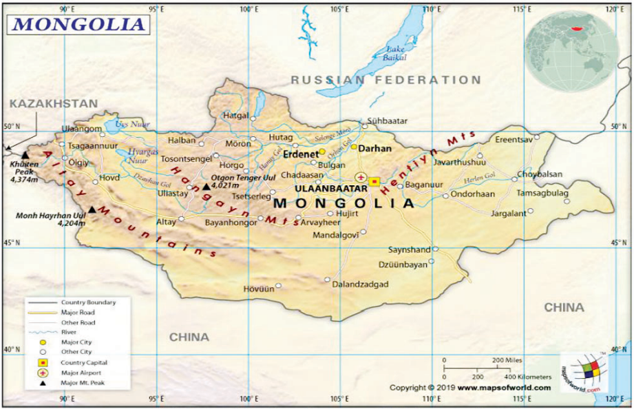
မွန်ဂိုလီးယားနိုင်ငံ၏ တည်နေရာ၊ နယ်နိမိတ်၊ အကျယ်အဝန်း။

မွန်ဂိုလီးယားနိုင်ငံသည် ၁၉၇၃ ခုနှစ်မှစတင်၍ ရွေးကောက်ပွဲ စတင်ကျင်းပခဲ့သည်။ ၁၉၇၇၊ ၁၉၈၁၊ ၁၉၈၆၊ ၁၉၉၀ ရွေးကောက်ပွဲများကို လေးနှစ်တစ်ကြိမ်ကျင်းပခဲ့သည်။ ၁၉၉၂ ခုနှစ်တွင် ပထမဆုံး ဖွဲ့စည်းပုံအခြေခံဥပဒေအသစ်ကို ရေးဆွဲခဲ့ပြီး လွှတ်တော်တစ်ရပ်စနစ်ကို စတင်ကျင့်သုံးခဲ့သည်။ ၁၉၉၃ ခုနှစ်တွင် ပထမဆုံးသမ္မတကို တိုက်ရိုက် ရွေးကောက်တင်မြှောက်သည့်စနစ်အား ကျင့်သုံးခဲ့သည်။ မွန်ဂိုလီးယားနိုင်ငံတွင် လေးနှစ်တစ်ကြိမ် ပါလီမန်ရွေးကောက်ပွဲ၊ သမ္မတရွေးကောက်ပွဲများကို အောက်ပါ ခုနှစ်များအလိုက်ကျင်းပသည်-