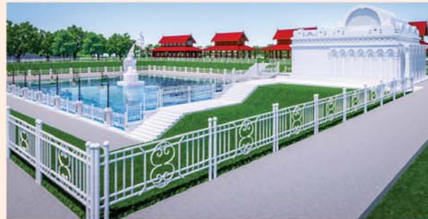
မုစလိန္နုတိုင်

၁။ နိုင်ငံတော်စီမံအုပ်ချုပ်ရေးကောင်စီဥက္ကဋ္ဌ၊ တပ်မတော်ကာကွယ်ရေးဦးစီးချုပ် ဗိုလ်ချုပ်မှူးကြီးမင်းအောင်လှိုင် ဦးဆောင်သည့် (၇)ရက်သား၊ သမီး၊ ဘုရားဒါယကာ၊ ဒါယိကာမတို့က မာရဝိဇယပုဒ္ဒရုပ်ပွားတော်မြတ်ကြီးအား မြန်မာနိုင်ငံတွင် ထေရဝါဒပုဒ္ဒသဘာသာတော်ထွန်းလင်းတောက်ပလျက်ရှိသည်ကို ကမ္ဘာကိုပြသရန်၊ တိုင်းပြည်အေးချမ်းသာယာမှုရှိစေရန်၊ ရုပ်ပွားတော်မြတ်ကြီးအား ပြည်တွင်း၊ ပြည်ပဘုရားဖူးများလာရောက်ခြင်းဖြင့် ဒေသတိုးတက်စည်ကားမှုကို အထောက်အကူဖြစ်စေရန်၊ နိုင်ငံတော်ဖွံ့ဖြိုးတိုးတက်မှုအား အထောက်အကူ ဖြစ်စေရန်ရည်သန်လျက် ပြည်ထောင်စုနယ်မြေ နေပြည်တော်၊ ဒက္ခိဏသီရိမြို့နယ်အတွင်း၌ သာသနာတော်ထုံး၊ ရုပ်ပွားဆင်းတုတော်ထုံး၊ မြန်မာ့ရိုးရာတည်ထုံးများနှင့်အညီ တည်ဆောက် ပူဇော်လျက်ရှိပါသည်။