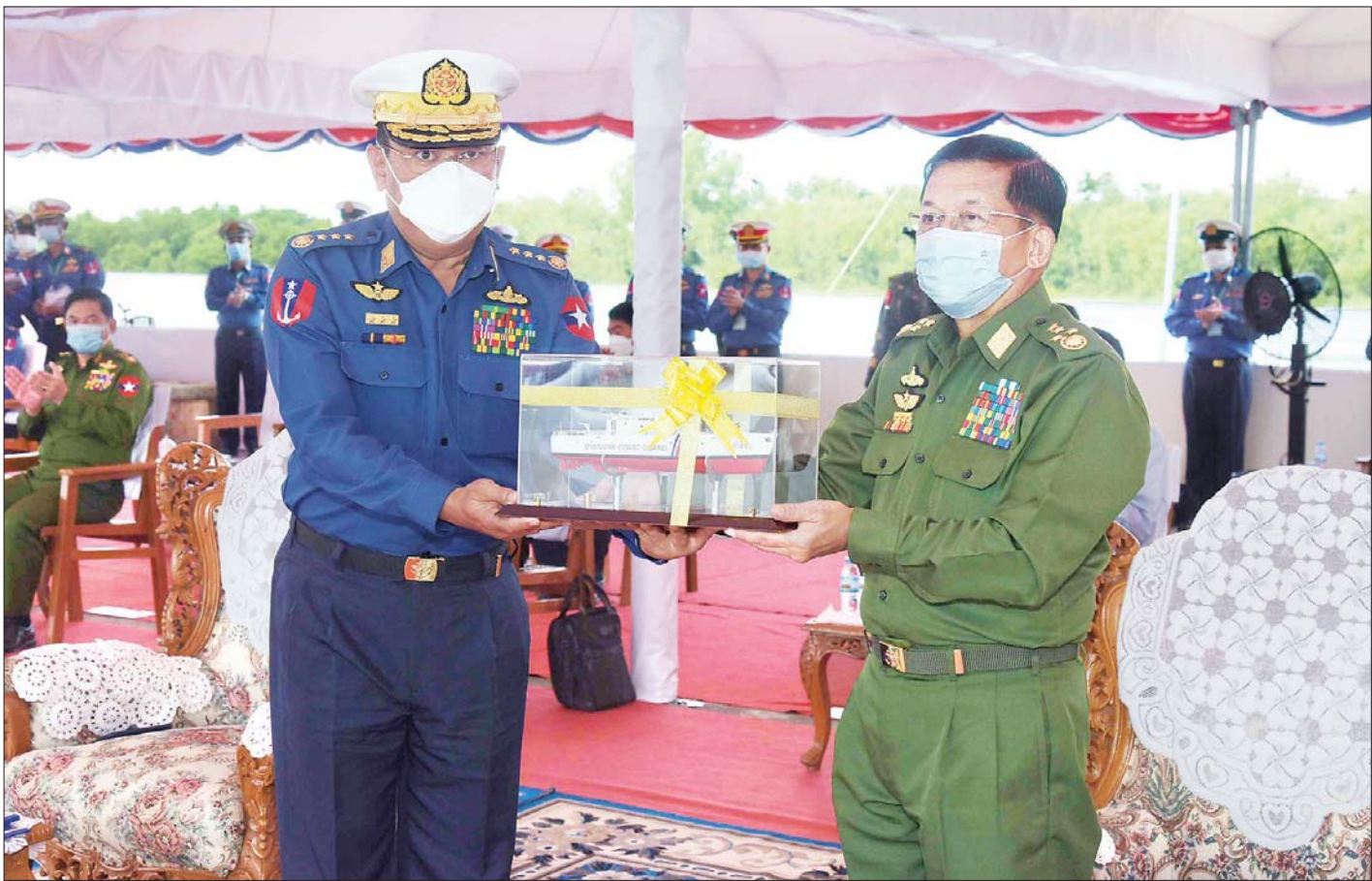
နိုင်ငံတော်စီမံအုပ်ချုပ်ရေးကောင်စီဥက္ကဋ္ဌ၊ တပ်မတော်ကာကွယ်ရေးဦးစီးချုပ် ဗိုလ်ချုပ်မှူးကြီး မင်းအောင်လှိုင်ထံသို့ ကာကွယ်ရေးဦးစီးချုပ်(ရေ)က စစ်ရေယာဉ်များ လွှဲပြောင်းပေးအပ်ခြင်းအထိမ်းအမှတ် စစ်ရေယာဉ်ပုံစံငယ်ကို ဂါရဝပြုပေးအပ်စဉ်။

ယင်းနောက် ဧရာဝတီရေတပ်စခန်းဌာနချုပ်၊ ဌာနချုပ်မှူးက ကမ်းခြေစောင့်တပ်ဖွဲ့ ညွှန်ကြားရေးမှူးချုပ်ထံသို့ ရေယာဉ်များနှင့် ပတ်သက်သော စာရွက်စာတမ်းများအား လွှဲပြောင်းပေးအပ်သည်။ ထို့နောက် ရေကြောင်းပို့ဆောင်ရေး ညွှန်ကြားမှုဦးစီးဌာန (Department of Marine Administration) မှ ခေတ္တညွှန်ကြားရေးမှူးချုပ်က ကမ်းခြေစောင့်