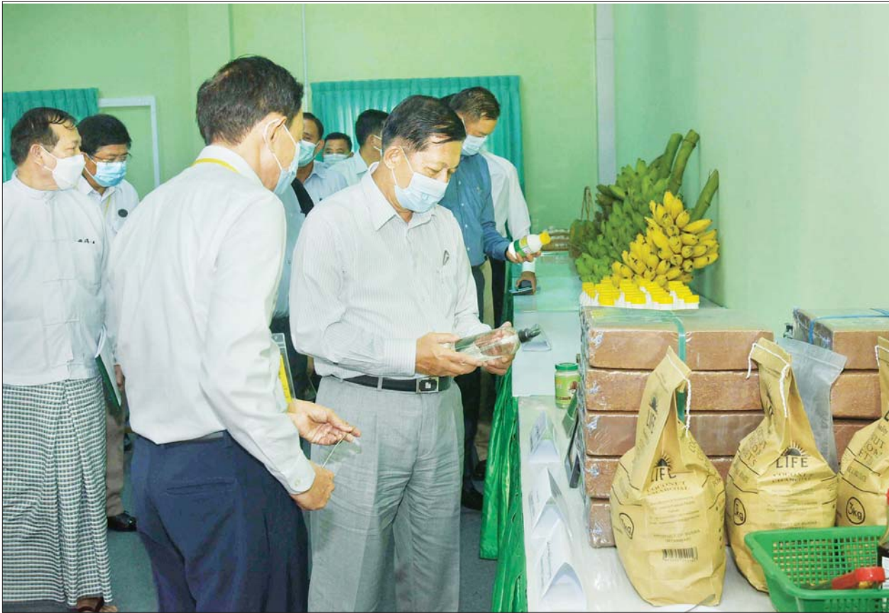
နိုင်ငံတော်စီမံအုပ်ချုပ်ရေးကောင်စီဥက္ကဋ္ဌ၊ နိုင်ငံတော်ဝန်ကြီးချုပ် ဗိုလ်ချုပ်မှူးကြီး မင်းအောင်လှိုင် သီလဝါဘက်စုံစိုက်ပျိုးမွေးမြူရေးဇုန်မှ ထွက်ရှိသည့် စိုက်ပျိုးရေးထွက်ကုန်နှင့် နို့ထွက်ပစ္စည်းများ ခင်းကျင်းပြသထားမှုကို ကြည့်ရှုစစ်ဆေးစဉ်။

(နိုင်ငံတော်စီမံအုပ်ချုပ်ရေးကောင်စီဥက္ကဋ္ဌ၊ နိုင်ငံတော်ဝန်ကြီးချုပ် ဗိုလ်ချုပ်မှူးကြီး မင်းအောင်လှိုင် ၂၇-၉-၂၀၂၁ ရက်နေ့တွင် ပြည်ထောင်စုသမ္မတမြန်မာနိုင်ငံတော် အိမ်စောင့်အစိုးရအဖွဲ့အစည်းအဝေးအမှတ်စဉ် (၂/၂၀၂၁) ၌ ပြောကြားသည့်အမှာစကားမှ ကောက်နုတ်ချက်)