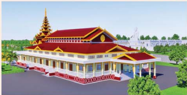
မွောင့်(၂၀၃x၉၀)ပေ ၁ လုံး-၈၇၃၀ သိန်း