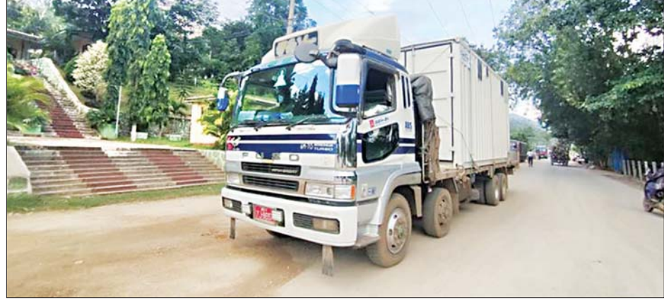
ချင်းရွှေဟော်နယ်စပ်ကုန်သွယ်ရေးစခန်းမှ Oxygen Plant များ တင်ဆောင်လာသည့် မော်တော်ယာဉ်။

ဆေးဝါးနှင့် ဆက်စပ်ပစ္စည်းများ တင်သွင်းခြင်းနှင့် သက်ဆိုင်သည့် အသိပေး ကြေညာချက်များကို လည်း အများပြည်သူသိရှိစေရန် ဝန်ကြီးဌာန Website ဖြစ်သည့် commerce.gov.mm တွင် ဝင်ရောက်ကြည့်ရှုနိုင်ရေး စီစဉ်ဆောင်ရွက်ပေးထားကြောင်း သိရသည်။ သတင်းစဉ်