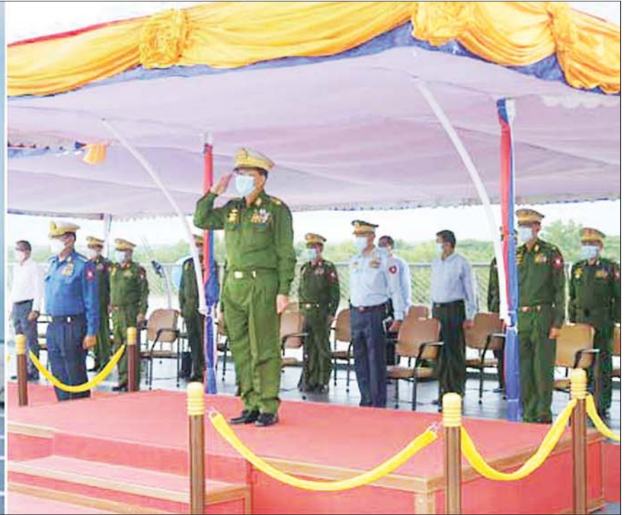
နိုင်ငံတော်စီမံအုပ်ချုပ်ရေးကောင်စီဥက္ကဋ္ဌ၊ တပ်မတော်ကာကွယ်ရေးဦးစီးချုပ် ဗိုလ်ချုပ်မှူးကြီး မင်းအောင်လှိုင်အား စစ်ရေယာဉ်များ၊ အမြန်သွားတိုက်ခိုက်ရေး ရေယာဉ်များနှင့် တိုက်ခိုက်ရေးလေယာဉ်များက သရုပ်ပြချီတက်အလေးပြုကြစဉ်။