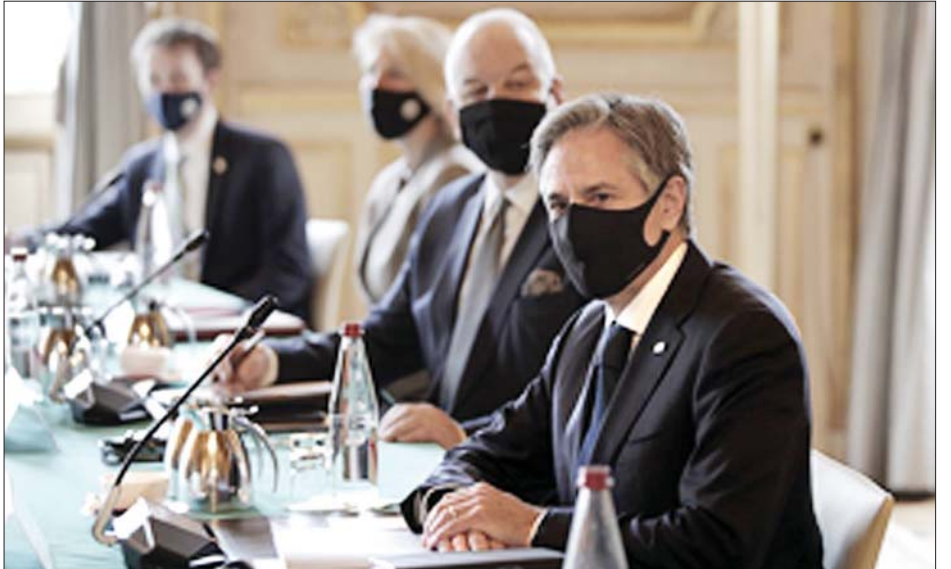
အောက်တိုဘာ ၅ ရက်က ဝါရှင်တန် အစည်းအဝေးတက်ရောက်နေသော အမေရိကန်နိုင်ငံခြားရေးဝန်ကြီး အန်တိုနီဘလင်ကန်နှင့် ပြင်သစ်နိုင်ငံခြားရေးဝန်ကြီးတို့ကို တွေ့ရစဉ်။

အမေရိကန်နိုင်ငံခြားရေးဝန်ကြီး အန်တိုနီဘလင်ကန်နှင့် ပြင်သစ်သမ္မတ အန်မန်ကျူရယ်မက်ရွန်တို့သည် ခပ်တန်းတန်းဖြစ်နေသည့် နှစ်နိုင်ငံဆက်ဆံရေးနှင့် အင်ဒိုပစိဖိတ်ဒေသတွင် ပူးပေါင်းဆောင်ရွက်ရေးဆိုင်ရာ ကိစ္စရပ်များကို ဆွေးနွေးရန် တွေ့ဆုံခဲ့သည်။