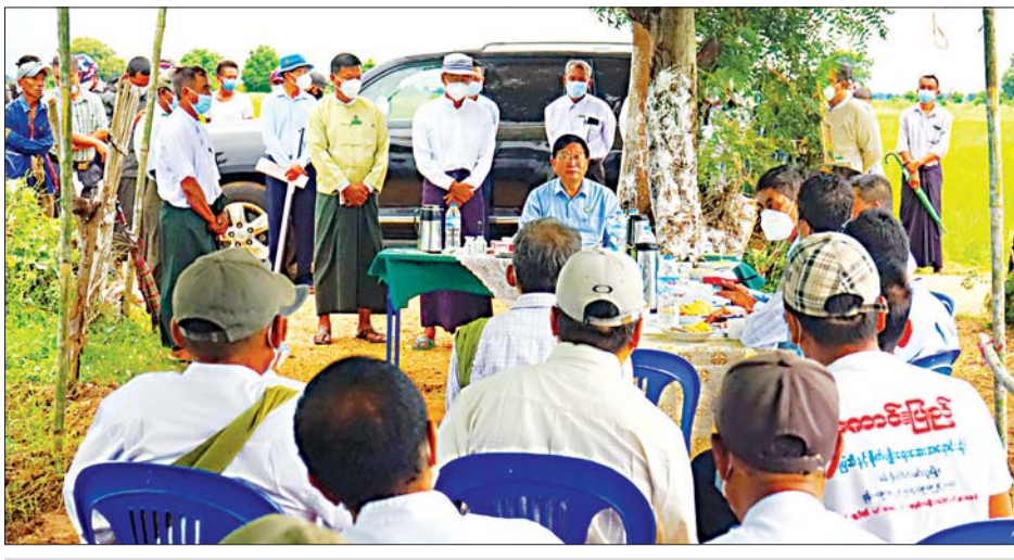
စိုက်ဧက ၂၀၀ ကျော်အထိ တိုးချဲ့နိုင်ရေးအတွက် တိုင်းဒေသကြီးဝန်ကြီးချုပ်နှင့် ဒေသခံတောင်သူများ ဆွေးနွေးစဉ်။

အထိ တိုးချဲ့ဆောင်ရွက်နိုင်ရေးနှင့် စိုက်ပျိုးရေးရရှိရေး အတွက် ရေမြောင်းများ ထပ်မံတိုးချဲ့ဆောင်ရွက် ပေးနိုင်ရေးကို တင်ပြကြသဖြင့် တိုင်းဒေသကြီး ဝန်ကြီးချုပ်က ပေါင်းစပ်ညှိနှိုင်း ဖြေရှင်းဆောင်ရွက် ပေးခဲ့ပြီး ဆည်မြောင်းနှင့် ရေအသုံးချမှု စီမံခန့်ခွဲရေး ဦးစီးဌာနအနေဖြင့် ဆက်လက်ဆောင်ရွက်ပေးရမည့် လုပ်ငန်းစဉ်များကိုလည်း မှာကြားသည်။ ကျောက်စံကျေးရွာတွင် ဖူးပွင့်မျိုးကောင်းမျိုးသန့် စိုက်ပျိုးထုတ်လုပ်ရေးသမဝါယမအသင်းလီမိတက် က လုံးသွယ်မွှေး မိုးစပါး မျိုးစေ့ထုတ်ကန်ထရိုက် စိုက်ခင်း ဧက ၁၀၀ ကို ကျောက်စံကျေးရွာအတွင်းရှိ ဒေသခံတောင်သူ ၂၇ ဦး၏ လယ်မြေ၌ ဩဂုတ် ၁၁ ရက်က ကောက်ကွက်စနစ်ဖြင့် စတင်အကောင် အထည်ဖော် စိုက်ပျိုးခဲ့ခြင်းဖြစ်ကြောင်း သိရသည်။ မောင်မောင် (မင်းဘူး)