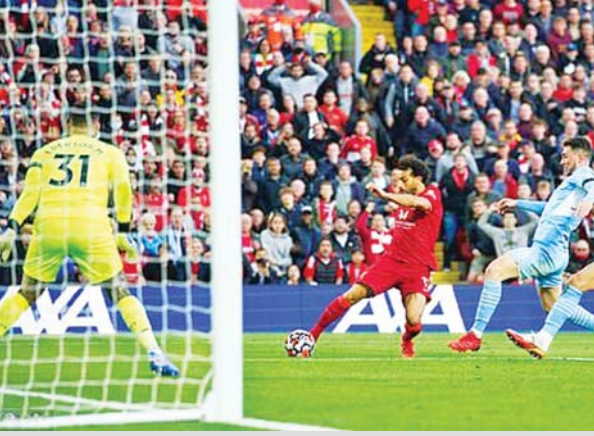
လီဗာပူးမှ ဆာလာ အသင်းအတွက် ဒုတိယဂိုး သွင်းယူပေးစဉ်။