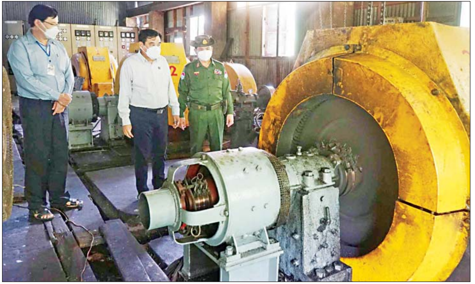
စာရင်းများ၊ နိုင်ငံသားစိစစ်ရေး ကတ်ပြားများ အားပေးခဲ့ကြောင်း သိရသည်။ ဆောင်ရွက်ပေးနေမှုအခြေအနေများကို ကြည့်ရှု တိုင်းဒေသကြီး(ပြန်/ဆက်)

ထို့နောက် တိုင်းဒေသကြီးဝန်ကြီးချုပ်သည် ဖောင်းတောကြီးကျေးရွာသို့ ရောက်ရှိပြီး ကျန်းမာ ရေးဦးစီးဌာနနှင့် လူမှုရေး အဖွဲ့အစည်းများ ပူးပေါင်းအဖွဲ့က ကျေးရွာနေ ပြည်သူများအား ကိုဗစ်-၁၉ ရောဂါ ကာကွယ်ဆေးထိုးနှံပေးနေမှု အခြေအနေနှင့် လူဝင်မှုကြီးကြပ်ရေးနှင့် ပြည်သူ့ အင်အားဝန်ကြီးဌာန ထားဝယ်မြို့နယ် ဦးစီးမှူး ရုံးမှ ပန်းခင်းစီမံချက်ဖြင့် အိမ်ထောင်စုလူဦးရေ