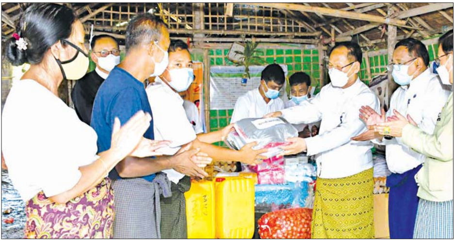
ပြည်နယ်ဝန်ကြီးချုပ်က နေရပ်စွန့်ခွာသူများအား အသုံးအဆောင်ပစ္စည်းများ ပေးအပ်နေစဉ်။

စစ်တွေ အောက်တိုဘာ ၃ ရခိုင်ပြည်နယ် ဝန်ကြီးချုပ် ဒေါက်တာ အောင်ကျော်မင်းနှင့် ပြည်နယ်ဝန်ကြီးများ၊ ဌာနဆိုင်ရာ တာဝန်ရှိသူများသည် မြောက်ဦးမြို့ သျှစ်သောင်းပရိယတ္တိ ဘုန်းတော်ကြီးကျောင်း၊ မြတန်ဆောင်း ပညာဒါနကျောင်းနှင့် မင်္ဂလာ အောင်စေတီဘုရား နေရပ်စွန့်ခွာ စခန်းများမှ နေရပ်စွန့်ခွာ သူများအား စက်တင်ဘာ ၃၀ ရက်က သွားရောက်တွေ့ဆုံကာ စားသောက်ကုန်နှင့် အသုံးအဆောင်များ ထောက်ပံ့ပေးအပ် သည်။