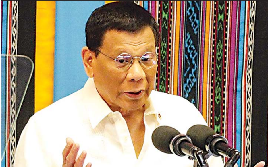
ဖိလစ်ပိုင်သမ္မတ ဒူတာတေး။