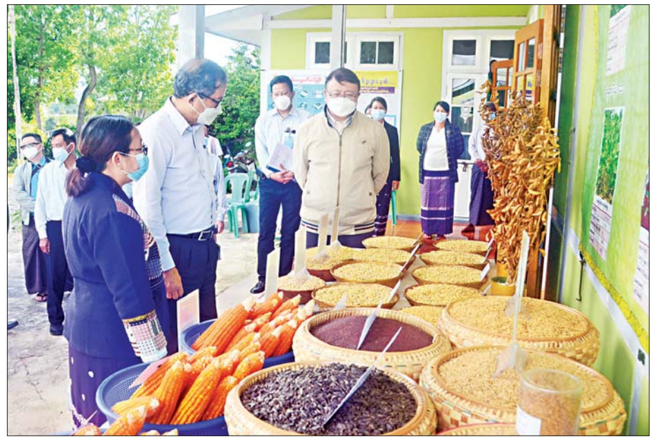
ပြည်ထောင်စုဝန်ကြီး ဦးတင်ထွဋ်ဦးနှင့် အဖွဲ့ဝင်များ အောင်ပန်း စိုက်ပျိုးရေးသုတေသနခြံမှ သုတေသနပြု ထုတ်လုပ်ထားသော အစေ့ထုတ်ပြောင်း၊ ပဲပုပ်နှင့် ဆီထွက် သီးနှံမျိုးစေ့နမူနာများကို ကြည့်ရှုစစ်ဆေးစဉ်။

ရှိသော အင်းလေးကန်အတွင်း သဲနုန်းများ ပိုချမှုကို ကာကွယ်ရန်အတွက် နုန်းထိန်းတာဝန်များ တည်ဆောက်ထိန်းသိမ်းရေး၊ ရေမှော်များ၊ ဗေဒါနှင့် ကျွန်းမြေဟောင်းများ ရှင်းလင်းရေးလုပ်ငန်းများ အပါအဝင် နှစ်စဉ်ဆယ်ယူလျက်ရှိသည့် နုန်းများကို စိုက်ပျိုးရေးလုပ်ငန်းတွင် ပြန်လည်အသုံးပြုနိုင်ရေး၊ ရှင်းလင်းဖယ်ရှားထားသည့် ရေမှော်များ၊ ဗေဒါနှင့် ဒိုက်များကို စိုက်ပျိုးရေးဦးစီးဌာနက သဘာဝမြေဩဇာ ပြုလုပ်အသုံးချရေး၊ ကျွန်းမြေစိုက်ခင်း များပေါ်တွင် အောင်မြင်စွာ ဆောင်ရွက်လျက်ရှိသည့် ကောင်းမွန်သော စိုက်ပျိုးရေး ကျင့်စဉ်(GAP) စနစ်နှင့်အညီ ခရမ်းချဉ်သီးနှင့် ဟင်းသီးဟင်းရွက်များ တိုးချဲ့စိုက်ပျိုးရေးလုပ်ငန်းကို သက်ဆိုင်ရာအစိုးရနှင့် ပုဂ္ဂလိကအဖွဲ့အစည်းများနှင့် ပူးပေါင်းဆောင်ရွက်ရေး ဆွေးနွေးသည်။ စနစ်တကျအသုံးပြု အလားတူ ဒေသငါးမျိုးဖြစ်သည့် ငါးဖိန်းငါးမျိုးများ ရွေးချယ်