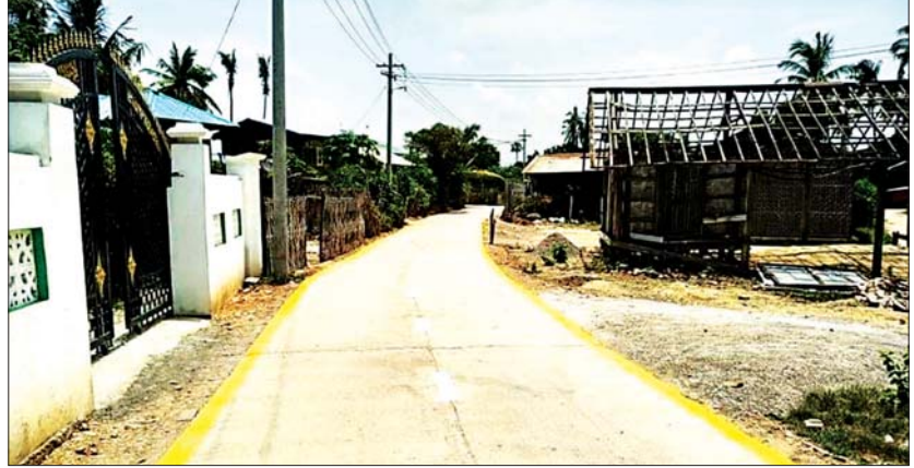
ကျေးရွာတစ်ရွာ၌ ဆောင်ရွက်ပြီးစီးနေသော ရွာတွင်းလမ်းတစ်ခု။

ခရိုင်အတွင်း မြို့နယ်အလိုက် ကျေးရွာဖွံ့ဖြိုးရေးလုပ်ငန်းများ ဆောင်ရွက်မှုမှာ ကျောက်ဆည်မြို့နယ်မှ ကျေးရွာ ၁၅ ရွာ၊ စဉ့်ကိုင်မြို့နယ်မှကျေးရွာ ၁၅ ရွာ၊ တံတားဦးမြို့နယ်မှကျေးရွာ ၁၉ ရွာ၊ မြစ်သာမြို့နယ်မှ ကျေးရွာ ၁၅ ရွာ၊ ပုသိမ်ကြီးမြို့နယ်မှ ကျေးရွာ ၁၄ ရွာ စုစုပေါင်းကျေးရွာ ၇၈ ရွာဖြစ်ပြီး လုပ်ငန်းအမျိုးအစားများမှာ ကျေးရွာတွင်း ကွန်ကရစ်လမ်းခင်းခြင်းလုပ်ငန်း ၇၃ ခု၊ ကွန်ကရစ်တံတား တည်ဆောက်ခြင်းလုပ်ငန်း တစ်ခု၊ သောက်သုံးရေရရှိရေးလုပ်ငန်းသုံးခု၊ လျှပ်စစ်မီးရရှိရေးလုပ်ငန်းတစ်ခုဖြစ်သည်။