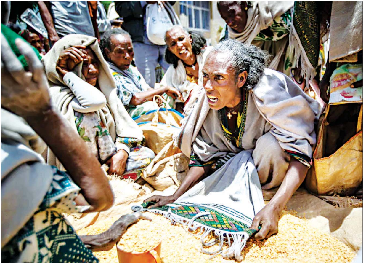
တီဂရေဒေသ၌ စားသောက်ကုန်ခွဲဝေရာတွင် အချင်းများနေသည့် အမျိုးသမီးတစ်ဦးကို တွေ့ရစဉ်။

စစ်ပွဲများကြောင့် အကြမ်းဖျင်းအားဖြင့် လူပေါင်း နှစ်သန်းနေရာရွှေ့ပြောင်းခဲ့ရပြီး ရာနှင့်ထောင်နှင့်ချီသည့်လူများမှာ ငတ်မွတ်ခေါင်းပါးမည့်ဘေးအန္တရာယ်နှင့် ကြုံတွေ့နေရသည်။ စက်တင်ဘာ ၃၀ ရက်တွင် အိသီယိုပီးယားနိုင်ငံအတွင်းမှ ကုလသမဂ္ဂအဖွဲ့အစည်း