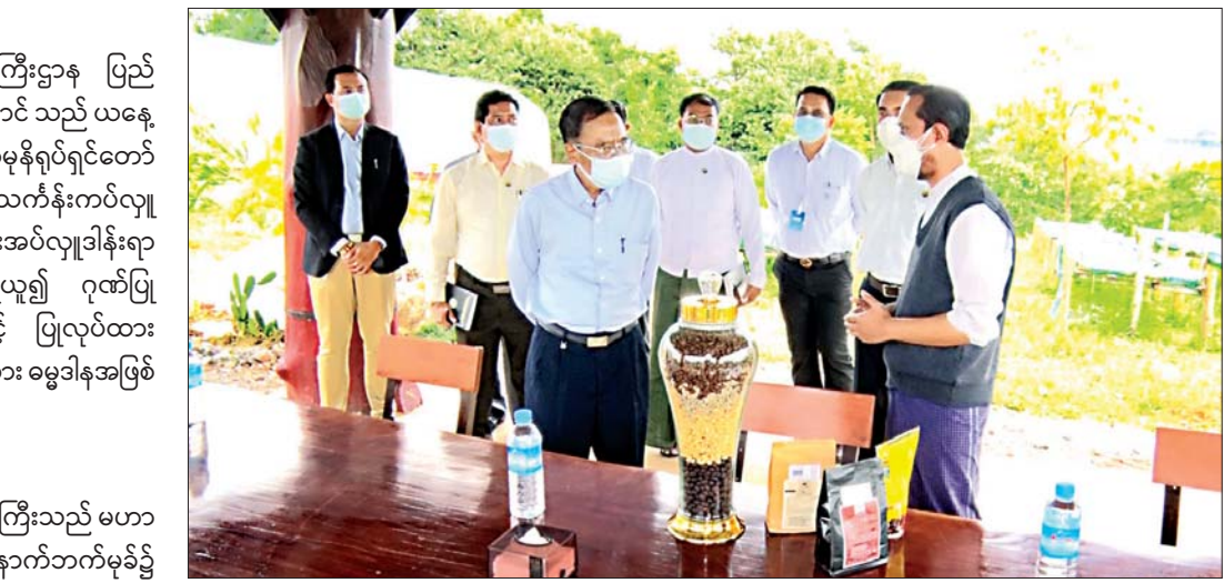
ပြည်ထောင်စုဝန်ကြီး ဒေါက်တာဌေးအောင်နှင့် အဖွဲ့ဝင်များ ပြင်ဦးလွင်မြို့နယ် ဖောင်းတောကျေးရွာရှိ ခရီးသွားလုပ်ငန်းနှင့် ဆက်စပ်လုပ်ကိုင်နေသည့် SITHAR COFFEE FARM ၌ ကြည့်ရှုစဉ်။

နေပြည်တော် စက်တင်ဘာ ၃ ဟိုတယ်နှင့် ခရီးသွားလာရေးဝန်ကြီးဌာန ပြည်ထောင်စုဝန်ကြီး ဒေါက်တာဌေးအောင် သည် ယနေ့နံနက်ပိုင်းတွင် မန္တလေးမြို့ရှိ မဟာမုနိရုပ်ရှင်တော်မြတ်ကြီးအား ပန်း၊ ရေချမ်းနှင့် ရွှေသင်္ကန်းကပ်လှူပူဇော်ပြီး ဘက်စုံအလှူငွေ ပေးအပ်လှူဒါန်းရာ ဂေါပကအဖွဲ့ဥက္ကဋ္ဌက လက်ခံရယူ၍ ဂုဏ်ပြုမှတ်တမ်းလွှာနှင့် ပန်းပေါင်းစုံဖြင့် ပြုလုပ်ထားသည့် မဟာမုနိဆင်းတုတော်မြတ်အား ဓမ္မဒါနအဖြစ် ပြန်လည်ပေးအပ်သည်။ ကြည့်ရှုစစ်ဆေး ယင်းနောက် ပြည်ထောင်စုဝန်ကြီးသည် မဟာမုနိရုပ်ရှင်တော်မြတ်ကြီး၏ အနောက်ဘက်မှခံ၍ ဘုရားပူးလာခရီးသွားဧည့်သည်များ ခရီးစဉ်ဒေသဆိုင်ရာ အချက်အလက်များ သိရှိလိုမှုများကို မေးမြန်းစုံစမ်းနိုင်ရန်အတွက် ဝန်ကြီးဌာနမှ ဖွင့်လှစ်ထားရှိသည့် Tourist Information Center ၌ လုပ်ငန်းဆောင်ရွက်နေမှုကို ကြည့်ရှုစစ်ဆေးပြီး ဂေါပကအဖွဲ့ဥက္ကဋ္ဌနှင့် Virtual Reality Tour ပြခန်းမြေနေရာရှိ နိုင်ငံခြား ညှိနှိုင်းဆောင်ရွက်သည်။ ထို့နောက် မန္တလေးမြို့ Pull Man Hotel အစည်းအဝေးခန်းမ၌ ဌာနဆိုင်ရာများ၊ မန္တလေးဇုန်ရှိ ဟိုတယ်နှင့်ခရီးသွားဆိုင်ရာ အသင်းအဖွဲ့များမှ တာဝန်ရှိသူများနှင့် ခရီးသွားကဏ္ဍ ဖွံ့ဖြိုးတိုးတက်ရေးဆိုင်ရာ ညှိနှိုင်းအစည်းအဝေးသို့ တက်ရောက်သည်။ အစည်းအဝေးတွင် ပြည်ထောင်စုဝန်ကြီးက ကိုဗစ် -၁၉ ကပ်ရောဂါနှင့် ယှဉ်တွဲပြီး ခရီးသွားလုပ်ငန်းပြန်လည်စတင်ရာတွင် ပြည်တွင်းခရီးစဉ်များကို အဓိကဆောင်ရွက်သွားမည်ဖြစ်ပြီး ပြည်တွင်းခရီးသွားမြှင့်တင်ရာတွင် ခရီးသွားများသာမက ခရီးသွားလုပ်ငန်းတွင် လုပ်ကိုင်နေသည့် ဝန်ထမ်းများ