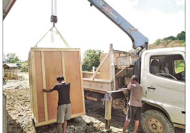
ပြည်သူများစုပေါင်းလှူဒါန်းသော အောက်ဆီဂျင်ထုတ်စက် ပုဏ္ဏားကျွန်းမြို့သို့ရောက်ရှိ

ထို့နောက် တိုင်းဒေသကြီးဝန်ကြီးချုပ်နှင့် တာဝန်ရှိသူများက မြစ်မီးရောင် (အသားကဏ္ဍ)အတွက် မှော်ဘီမြို့နယ် ကျွဲခေါင်းအင်း ကျေးရွာနှင့် ကြိမ်ပိုက်ကျေးရွာသို့ ဝက်မွေးမြူရန် မတည်ငွေကျပ်သိန်း ၃၀၀၊ တိုက်ကြီးမြို့နယ် အုန်းပင်စုကျေးရွာသို့ ဒေသခံမွေးမြူရေး အတွက် မတည်ငွေကျပ်သိန်း ၃၀၀၊ မှော်ဘီမြို့နယ် ရေတာကျေးရွာသို့ မျိုးကောင်းမျိုးသန့် တိရစ္ဆာန်ဝယ်ယူဖြန့်ဖြူးရေးအတွက် နွားမွေးမြူရန် မတည်ငွေကျပ် သိန်း ၃၀၀ စုစုပေါင်းငွေကျပ်သိန်း ၉၀၀ ကို ထောက်ပံ့ ပေးအပ်ကြောင်း သိရသည်။ ဇွဲထက်ကို(ပြန်/ဆက်)