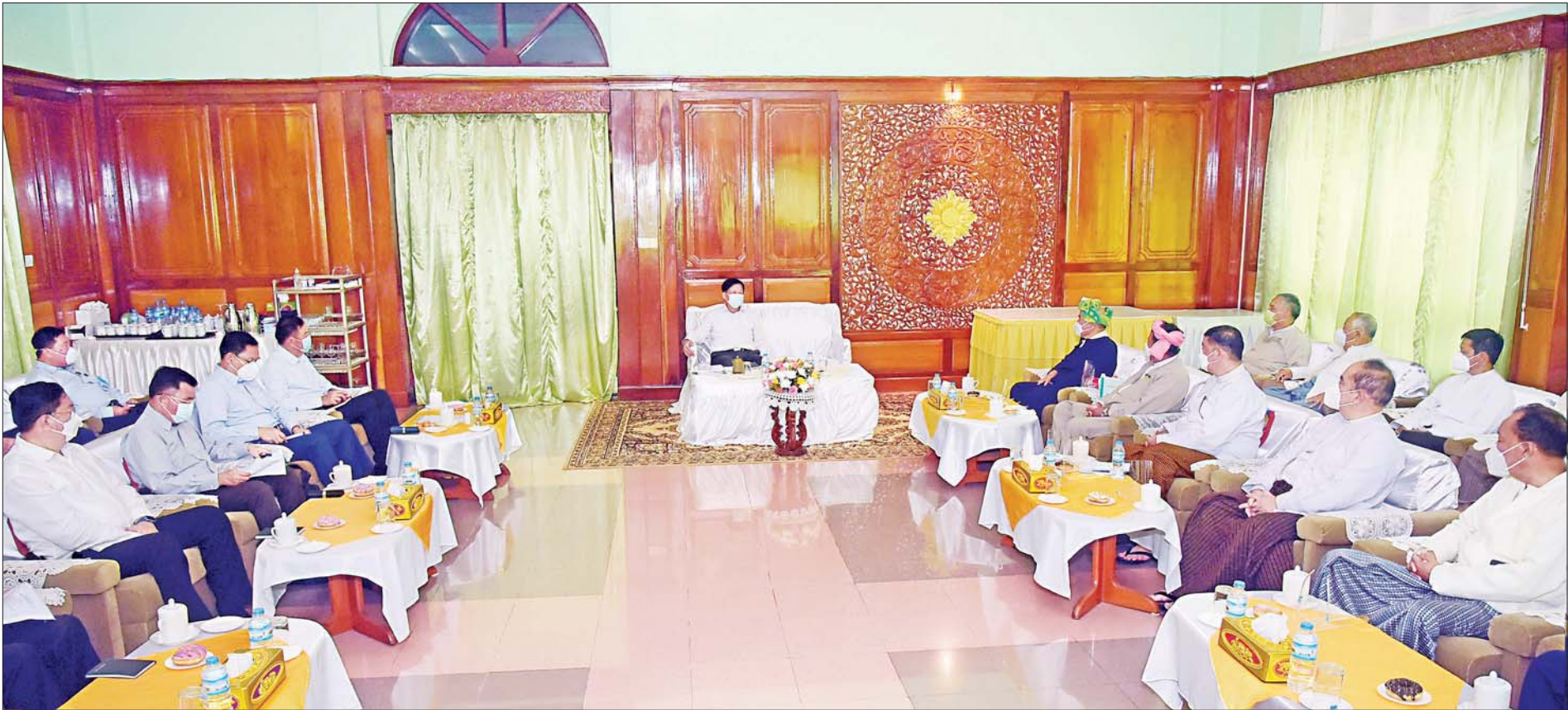
နိုင်ငံတော်စီမံအုပ်ချုပ်ရေးကောင်စီဥက္ကဋ္ဌ၊ နိုင်ငံတော်ဝန်ကြီးချုပ် ဗိုလ်ချုပ်မှူးကြီး မင်းအောင်လှိုင် ကလောမြို့နှင့် အောင်ပန်းမြို့တို့ရှိ ဒေသခံမြို့မမြို့ဖများ၊ စီးပွားရေးလုပ်ငန်းရှင်များနှင့် တွေ့ဆုံဆွေးနွေးစဉ်။

၄။ တစ်နိုင်ငံလုံး ထာဝရငြိမ်းချမ်းရေးရရှိရေးအတွက် တစ်နိုင်ငံလုံး ပစ်ခတ်တိုက်ခိုက်မှု ရပ်စဲရေးသဘောတူစာချုပ် (NCA) ပါ သဘောတူညီချက်များအတိုင်း ဖြစ်နိုင်သမျှ အလေးထား လုပ်ဆောင်သွားမည်။ ၅။ အရေးပေါ်ကာလဆိုင်ရာ ပြဋ္ဌာန်းချက်များနှင့်အညီ ဆောင်ရွက်ပြီးစီးပါက ဖွဲ့စည်းပုံအခြေခံဥပဒေ (၂၀၀၈ ခုနှစ်) နှင့်အညီ လွတ်လပ်ပြီး တရားမျှတသော ပါတီစုံဒီမိုကရေစီအထွေထွေရွေးကောက်ပွဲအား ပြန်လည်ကျင်းပ၍ အနိုင်ရသည့်ပါတီအား ဒီမိုကရေစီစံနှုန်းများနှင့်အညီ နိုင်ငံတော်တာဝန်အား လွှဲအပ်နိုင်ရေး ဆက်လက်ဆောင်ရွက်သွားမည်။