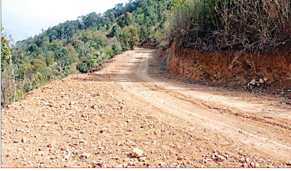
ဖောက်လုပ်ပြီးစီးနေသည့် ကျေးလက်လမ်းပိုင်းတစ်ခုခုပုံ။

စက်ပစ္စည်းများ သွားလာရေး အတွက်လည်း အကျိုးပြုလျက် ရှိကြောင်း ကန်ပက်လက်မြို့နယ် ကျေးလက်ဒေသ ဖွံ့ဖြိုးတိုးတက် ရေးဦးစီးဌာနမှူး ဦးထန်းအွမ်က ပြောသည်။ စိုးမိုးကျော်