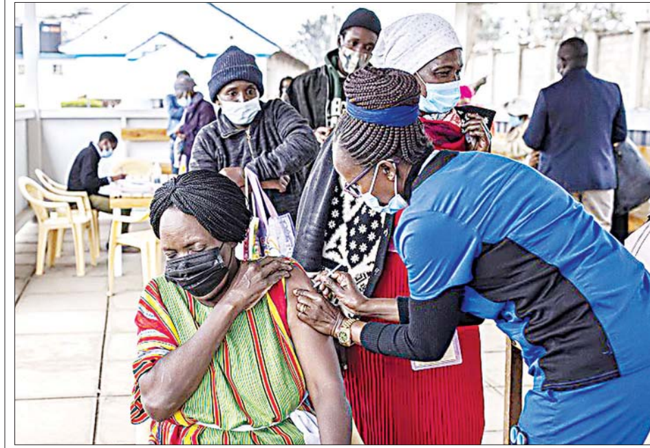
ကင်ညာနိုင်ငံ နိုင်ရီဘီမြို့ရှိ ဆေးရုံတစ်ရုံတွင် ကိုဗစ် -၁၉ ကာကွယ်ဆေးထိုးပေးနေစဉ်။

အစ္စအဘာဘာ အောက်တိုဘာ ၃ - အာဖရိက၌ ကိုဗစ် -၁၉ ကူးစက်မှုများမှာ အောက်တိုဘာ ၂ ရက်တွင် ၈၃၂၆၉၂၅ ဦးရှိလာ သည်ဟု အာဖရိက ရောဂါ ထိန်းချုပ်ရေးနှင့် ကာကွယ်ရေး ကူးစက်မှုများမှာ အောက်တိုဘာ ၂ ရက်တွင် ၈၃၂၆၉၂၅ ဦးရှိလာ သည်ဟု အာဖရိက ရောဂါ ထိန်းချုပ် ရေးနှင့် ကာကွယ်ရေးစင်တာသည် အာဖရိကသမဂ္ဂ၏ အထူးကျန်းမာရေးစောင့်ရှောက်မှု အေဂျင်စီ ဖြစ်ပြီး အာဖရိကတိုက်တွင် ကိုဗစ်-၁၉ ကြောင့် သေဆုံးမှုနှုန်း မှာလည်း ၂၁၀၈၄၂ ဦးရှိသည်ဟု အဆိုပါအေဂျင်စီက ပြောသည်။ အာဖရိကတိုက် တစ်လွှား ပြန်လည်ကျန်းမာလာသူ အရေ အတွက်မှာ ၇၆၆၄၈၈၆ ဦးရှိပြီ ဖြစ်သည်။ တောင်အာဖရိက၊ မော်ရိုကို၊ တူနီးရှားနှင့် အီသီယိုးပီးယားနိုင်ငံတို့မှာ အာဖရိက တိုက်တွင် ကိုဗစ်-၁၉ ကူးစက်မှု မြင့်မားသည့် နိုင်ငံများဖြစ်ကြ သည်။ ရေတွက်မှုများအရ တောင် အာဖရိကမှာ ကူးစက်မှုအများဆုံး ဒေသဖြစ်ပြီး ၎င်းနောက်တွင် မြောက်ပိုင်းနှင့် အရှေ့ပိုင်း ဒေသတို့တွင် ကူးစက်မှုများပြား သည်ဟု အာဖရိက ရောဂါ ထိန်းချုပ်ရေးနှင့် ကာကွယ်ရေး စင်တာအရ သိရသည်။