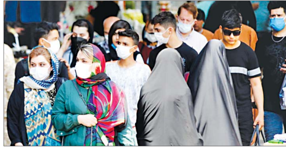
တီဟီရန်မြို့ ဈေးတစ်ခုအတွင်း ပါးစပ်၊နှာခေါင်းစည်းဝတ်ဆင်ထားသည့် အီရန်အမျိုးသမီးများကို တွေ့ရစဉ်။

တီဟီရန် အောက်တိုဘာ ၃ - အီရန်နိုင်ငံ၌ ကိုဗစ် -၁၉ ကူးစက်မှုများကြောင့် အသွားအလာ ကန့်သတ်မှုများနှင့် ပတ်သက်သည့် ကန့်သတ်မှုများ အစား စနစ်ကျသည့် ကန့်သတ်မှုများကို တဖြည်းဖြည်းချင်း အစားထိုးသွားမည်ဟု အီရန် သမ္မတ အီဘရာဟင်ရိုင်းစီက အောက်တိုဘာ ၂ ရက်တွင် ပြောသည်။ အီရန်သမ္မတသည် အမျိုးသား ကိုဗစ်-၁၉ ကာကွယ်ဆေးထိုးပေးရေး အစည်းအဝေးတွင် ပြောကြားခဲ့ပြီး အသက် ၁၂ နှစ်နှင့်အထက် ကလေးများကို ကာကွယ်ဆေးထိုးပေးရန် ပညာရေးဌာနနှင့် ကျန်းမာရေးဌာနတို့ ပူးပေါင်းဆောင်ရွက်ကြရန် တောင်းဆိုခဲ့သည်။ ကိုဗစ် -၁၉ တိုက်ဖျက်ရေးအတွက် တစ်ကိုယ်ရေသန့်ရှင်းမှု အသိ ကင်းမဲ့ခြင်းသည် အလွန် အန္တရာယ်ကြီးကြောင်းနှင့် ကျန်းမာရေးဆိုင်ရာ စည်းမျဉ်း စည်းကမ်းများကို တင်းတင်းကျပ်ကျပ် ချမှတ်သင့်ကြောင်း ၎င်းက ပြောသည်။ ကာကွယ်ဆေးထိုးခြင်းဖြင့် လူများအတွက် အလုံးစုံ စိတ်ချ သွားရသည်ဆိုသည့် အတွေးမှာ မှားယွင်းသည့် အယူအဆဖြစ်ကြောင်း ၎င်းက ပြောသည်။ အောက်တိုဘာ ၁ ရက်အထိ အီရန် နိုင်ငံ၌ စုစုပေါင်း ကူးစက်ခံရသူ ၅၆၀၁၅၆၅ ဦးရှိပြီး သေဆုံးသူ အရေအတွက်မှာလည်း ၁၂၀၆၆၃ ဦး ရှိသည်။ ပြီးခဲ့သည့် သီတင်းပတ်များမှစတင်ကာ အီရန်နိုင်ငံတွင် ကိုဗစ် -၁၉ နောက်ထပ် ကူးစက်မှုနှုန်းနှင့် သေဆုံးမှုနှုန်းမှာ ကျဆင်းလာခဲ့သည်။