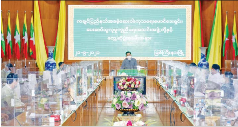
ပြည်နယ် ဝန်ကြီးချုပ် ဦးခက်ထိန်နန် နှင့် ပရဟိတ လူမှုကူညီရေး အသင်းအဖွဲ့ များ ညှိနှိုင်း ဆွေးနွေးပွဲ ကျင်းပစဉ်။