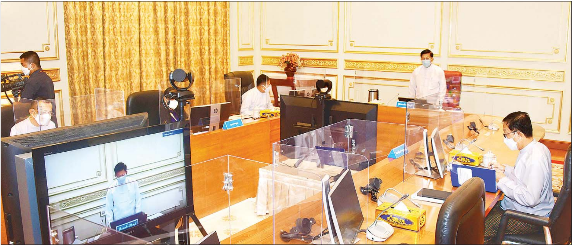
ဘဏ္ဍာရေးဆိုင်ရာကော်မရှင်ဥက္ကဋ္ဌ၊ နိုင်ငံတော်စီမံအုပ်ချုပ်ရေးကောင်စီ ဥက္ကဋ္ဌ၊ နိုင်ငံတော်ဝန်ကြီးချုပ် ဗိုလ်ချုပ်မှူးကြီး မင်းအောင်လှိုင် ဘဏ္ဍာရေးဆိုင်ရာကော်မရှင်အစည်းအဝေး အမှတ်စဉ် (၁/၂၀၂၀)တွင် အမှာစကားပြောကြားစဉ်။