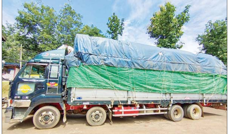
မြဝတီ၊ ချင်းရွှေဟော် နယ်စပ်ကုန်သွယ်ရေးစခန်းများမှ အောက်ဆီဂျင်အရည်နှင့် ကိုဗစ်-၁၉ ရောဂါ ကာကွယ်၊ ထိန်းချုပ်၊ ကုသရေးဆိုင်ရာပစ္စည်းများ တင်သွင်းလာစဉ်။