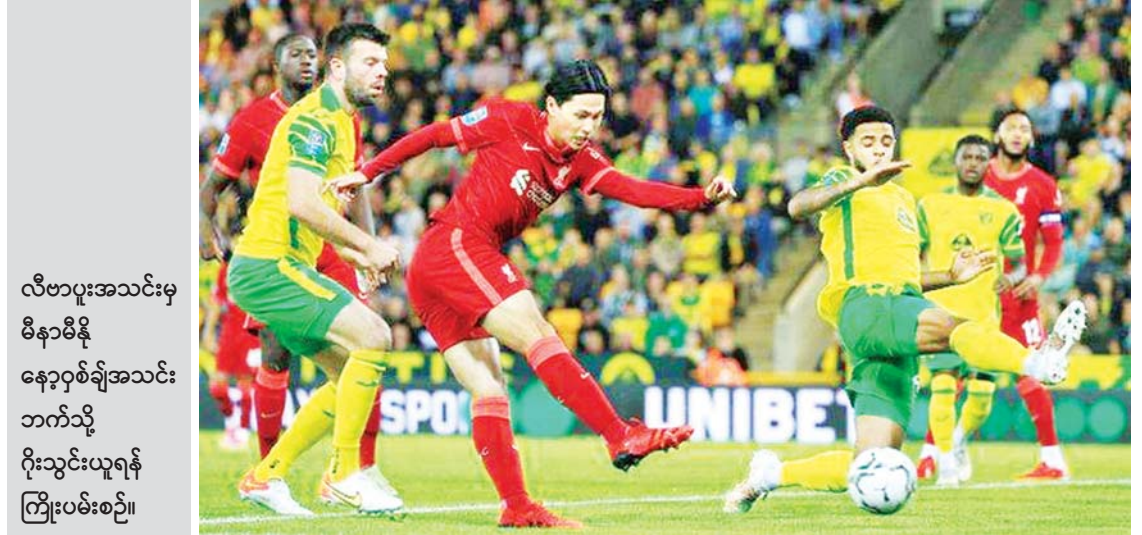
လီဗာပူးအသင်းမှ မိနာမိနီ နော့ဂရစ်ချ်အသင်း ဘက်သို့ ဂိုးသွင်းယူရန် ကြိုးပမ်းစဉ်။

ကျောဖုံးမှ ပွဲစဉ်ရေးဆွဲထားမှုအရ မြန်မာအသင်း သည် စင်ကာပူ၊ ခြေစစ်ပွဲအောင် အသင်း၊ ထိုင်းအသင်းတို့နှင့် ပွဲများကို နှစ်ရက်ခြား သုံးပွဲဆက်ကစားရမည်ဖြစ်သော်လည်း နောက်ဆုံးပွဲဖြစ်သည့် ဖိလစ်ပိုင်နှင့် ပွဲစဉ်မီ နားရက်ခြောက်ရက် ရရှိမည် ဖြစ်သည်။ အုပ်စုအနေအထားအရ မြန်မာ အသင်းသည် ဆီမီးပိုင်နယ်တက်ရောက် ရန် စင်ကာပူ၊ ထိုင်း၊ ဖိလစ်ပိုင်တို့နှင့်ပွဲ များမှာ အရေးပါလျက်ရှိသည်။ မြန်မာအသင်းသည် အုပ်စုတွင် ပြိုင်ဘက်များအနက် စင်ကာပူ၊ ထိုင်း အသင်းတို့နှင့် ၂၀၁၄ ပြိုင်ပွဲ၊ ဖိလစ်ပိုင် အသင်းနှင့် ၂၀၁၂ ပြိုင်ပွဲတို့တွင် အုပ်စု အဆင့်၌ နောက်ဆုံးတွေ့ဆုံခဲ့သည်။ ခြေစစ်ပွဲကစားမည့် အသင်းများအနက် တီမောအသင်းနှင့် ၂၀၀၄ ပြိုင်ပွဲတစ်ခုသာ အုပ်စုအဆင့်တွင် တွေ့ဆုံဖူးပြီး ဘရန့်ဖွဲ့ အသင်းနှင့် တွေ့ဆုံဖူးခြင်းမရှိကြောင်း သိရသည်။ ရရင့်လွင်