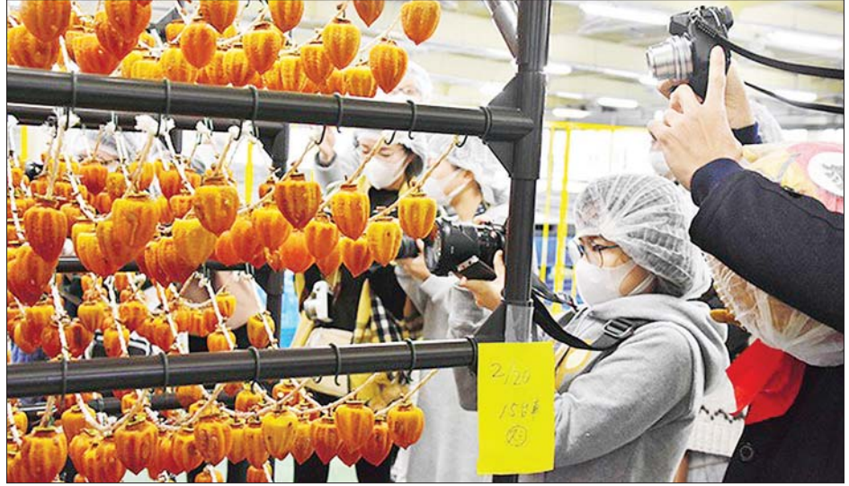
ဂျပန်နိုင်ငံ၏ အစားအစာအချို့ကို တွေ့ရစဉ်။