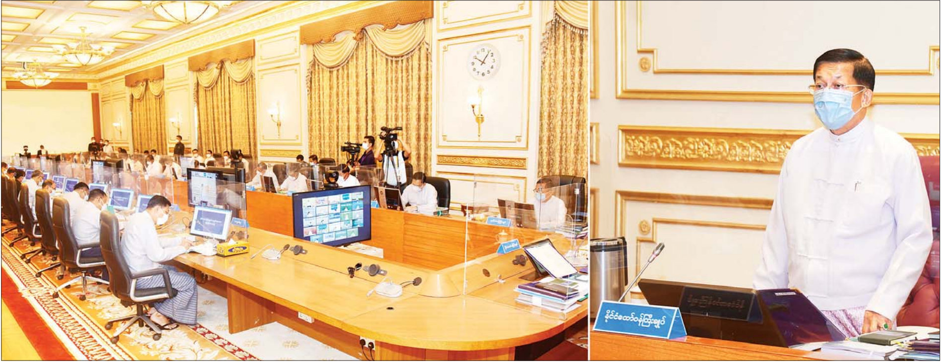
အမျိုးသားစီမံကိန်းကော်မရှင်ဥက္ကဋ္ဌ၊ နိုင်ငံတော်စီမံအုပ်ချုပ်ရေးကောင်စီဥက္ကဋ္ဌ၊ နိုင်ငံတော်ဝန်ကြီးချုပ် ဗိုလ်ချုပ်မှူးကြီး မင်းအောင်လှိုင် အမျိုးသားစီမံကိန်းကော်မရှင် အစည်းအဝေးအမှတ်စဉ် (၁/၂၀၂၁) တွင် အမှာစကား ပြောကြားစဉ်။