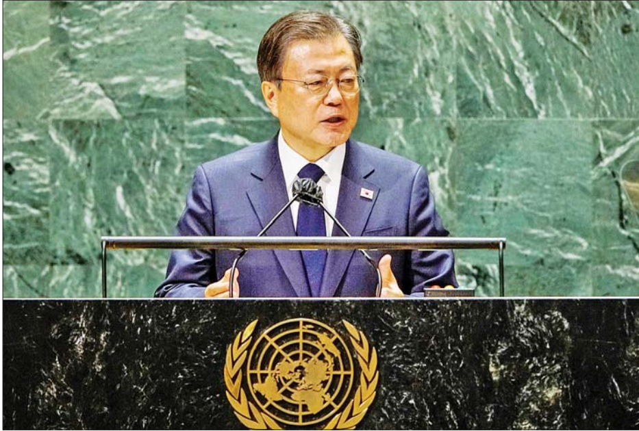
တောင်ကိုရီးယားသမ္မတ မွန်ဂျေအင်း ကုလသမဂ္ဂလုံခြုံရေးကောင်စီတွင် မိန့်ခွန်းပြောကြားစဉ်။

ဂျီနီဗာ စက်တင်ဘာ ၂၂ တောင်ကိုရီးယားသမ္မတ မွန်ဂျေအင်းက ကိုရီးယား စစ်ပွဲ တရားဝင်အဆုံးသတ်ရန်နှင့် ကိုရီးယား ကျွန်းဆွယ်ငြိမ်းချမ်းရေး ဖော်ဆောင်ရန် ထပ်လောင်း ပြောကြားလိုက်သည်။