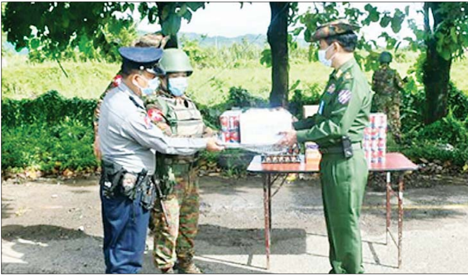
နေပြည်တော် စက်တင်ဘာ ၂၂

ကိုဗစ်-၁၉ ရောဂါ ကာကွယ်၊ ထိန်းချုပ်၊ ကုသရေးလုပ်ငန်းများကို အရှိန်အဟုန်မြှင့် ဆောင်ရွက်လျက်ရှိရာ သွားလာမှုကန့်သတ်ချက်များကြောင့် စစ်မှုထမ်းဟောင်းအဖွဲ့ဝင်များ၊ မြန်မာနိုင်ငံရဲတပ်ဖွဲ့ဝင်များ၊ ပြည်သူ့စစ် (ဌာန)တပ်ဖွဲ့ဝင်များ၊ ကျန်းမာရေးဝန်ထမ်းများ၊ စေတနာ့ဝန်ထမ်း (Volunteer) များနှင့် ဒေသခံပြည်သူများ စားရေးအစာပြေစေရေးအတွက် တပ်မတော်နှင့် စေတနာ့ရှင်အလှူရှင်များက စားသောက်ဖွယ်ရာများနှင့် ရောဂါ ကာကွယ်ရေး အထောက်အကူပြုပစ္စည်းများကို ထောက်ပံ့ပေးအပ်လှူဒါန်းလျက်ရှိသည်။