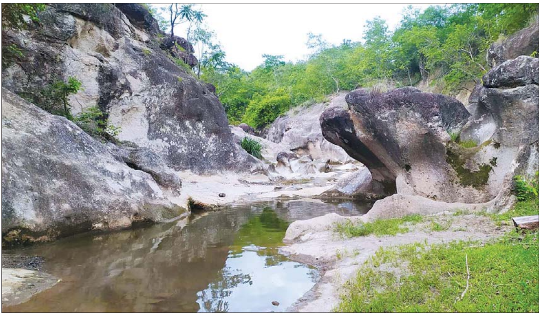
ပုပ္ပားတောင်ပတ်လည်ခရီးစဉ်အတွင်း ပါဝင်သည့် သဘာဝကျောက်ရေကန်တစ်ကန်။

ညောင်ဦးမြို့နှင့် မိုင် ၃၀ ခန့်ဝေးကွာသည့် ကျောက်ပန်းတောင်းမြို့နယ်မှ ပုပ္ပားတောင်မကြီးခရီးစဉ်ကို စတင်ရန် ပုပ္ပားတောင်မကြီး တောင်ဘက်ခြမ်းရှိ ကျောက်ပန်းတောင်းမြို့မှ မိတ္ထီလာမြို့ အထွက် ခုနစ်မိုင်ခန့်အကွာမှ စတင် ဝင်ရောက်ရပြီး လဲဝရွာ၊ လက်ပံအိုင်ရွာ သို့ စတင်ရောက်ရှိမည်ဖြစ်သည်။ လဲဝရွာ၊ လက်ပံအိုင်ရွာသို့ မရောက်မီ မကျည်းတိုင်းအုပ်စု ပြည်ဝရွာ မြောက်ဘက် မတ်တစ်ထောင် (ငရဲ တောင်တန်း) တွင် တည်ထားကိုးကွယ် ထားသည့် မဟာဗုဒ္ဓငါးထောင်၊ မဟာ ဗောဓိငါးထောင်ကို ဝင်ရောက်လေ့လာ ဖူးမြော်နိုင်သည်။