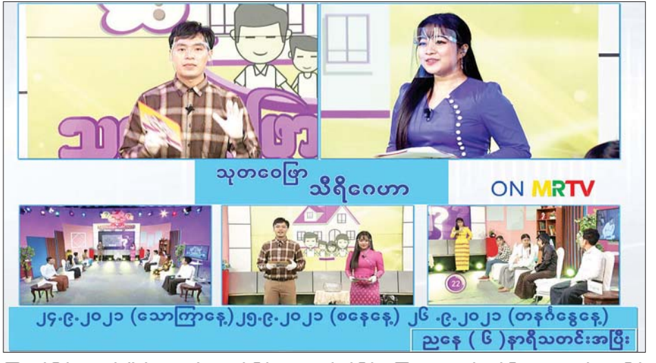
၂၄-၉-၂၀၂၁ (သောကြာနေ့)၊ ၂၅-၉-၂၀၂၁ (စနေနေ့)၊ ၂၆-၉-၂၀၂၁ (တနင်္ဂနွေနေ့) ညနေ ( ၆ )နာရီသတင်းအပြီး