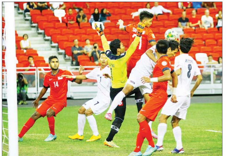
၂၀၁၄ ခုနှစ် အာဆီယံဆူဇူကီးဖလားပြိုင်ပွဲတွင် မြန်မာအသင်းနှင့် စင်ကာပူအသင်းတို့ တွေ့ဆုံခဲ့စဉ်။

သွားမည်ဖြစ်သည်။ ဆီမီးဖိုင်နယ် ပထမ အကျော့ကို ဒီဇင်ဘာ ၂၂၊ ၂၃ ရက်၊ ဒုတိယ အကျော့ကို ဒီဇင်ဘာ ၂၅၊ ၂၆ ရက်၊ ဗိုလ်လုပွဲ ပထမအကျော့ကို ဒီဇင်ဘာ ၂၉ ရက်၊ ဒုတိယအကျော့ကို ဇန်နဝါရီ ၁ ရက်တွင် ကျင်းပမည်ဖြစ်သည်။ ပွဲစဉ်ရေးဆွဲထားမှု အရ မြန်မာအသင်းသည် ဒီဇင်ဘာ ၅ ရက် တွင် စင်ကာပူအသင်း၊ ဒီဇင်ဘာ ၈ ရက်တွင် ခြေစစ်ပွဲအောင်အသင်း၊ ဒီဇင်ဘာ ၁၁ ရက် တွင် ထိုင်းအသင်း၊ ဒီဇင်ဘာ ၁၈ ရက်တွင် ဖိလစ်ပိုင်အသင်းနှင့် ယှဉ်ပြိုင်ကစားရမည် ဖြစ်သည်။ စာမျက်နှာ ၁၂ ကော်လံ ၅ ၀