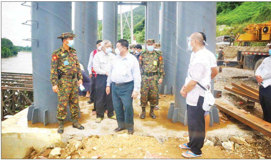
တံတားတည်ဆောက်ရေးလုပ်ငန်းကို ပြည်နယ်ဝန်ကြီးချုပ် ကွင်းဆင်းကြည့်ရှုစဉ်။

လားရှိုး စက်တင်ဘာ ၂၂ ရှမ်းပြည်နယ် ကွမ်းလုံမြို့၌ အသစ်တည်ဆောက် လျက်ရှိသော သံလွင်မြစ်ကူး(ကွမ်းလုံ)တံတားသစ် တည်ဆောက်ရေးစီမံကိန်း ဆောင်ရွက်နေမှုအခြေ အနေများကို ပြည်နယ်ဝန်ကြီးချုပ် ဒေါက်တာ ကျော်ထွန်း၊ အရှေ့မြောက်တိုင်းစစ်ဌာနချုပ် တိုင်းမှူး ဗိုလ်ချုပ်နိုင်နိုင်ဦး၊ ကိုးကန့်ကိုယ်ပိုင်အုပ်ချုပ်ခွင့်ရ ဒေသ ဥက္ကဋ္ဌဦးမြင့်ဆွေ၊ 'ဝ' ကိုယ်ပိုင်အုပ်ချုပ်ခွင့်ရတိုင်း ဥက္ကဋ္ဌဦးညီနပ် နှင့်တာဝန်ရှိသူများသည် စက်တင်ဘာ ၂၀ ရက်က ကွင်းဆင်းစစ်ဆေးကြည့်ရှုသည်။