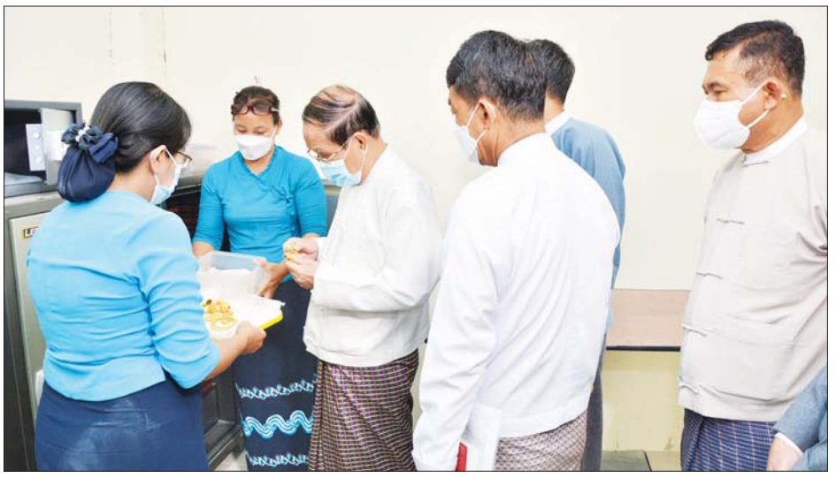
အောင် ခင်းကျင်းရန်၊ အများဝန်ကြီးဌာနက ထုတ်ပြန်ထား ဆောင်ရွက်ထားရှိရန် မှာကြားခဲ့ ပြည်သူများအား ဖွင့်လှစ်ပြသ သည့် ကိုဗစ်-၁၉ စည်းကမ်းချက် ကြောင်း သိရသည်။ နိုင်ငံရေးအတွက် ကျန်းမာရေး များနှင့်အညီ ကြိုတင်ပြင်ဆင် သတင်းစဉ်

မြန်မာ့ယဉ်ကျေးမှုများနှင့် မြန်မာလူမျိုး၏ စွမ်းဆောင်ချက် (Soft Power) များကို ဖော်ထုတ်ပြသရန်၊ ခေတ်မီ ဆွဲဆောင်မှုရှိပြီး ထိန်းသိမ်းမှုစနစ်၊ ပြသမှုစနစ် မှန်ကန်ကာ အဆင့်အတန်းမြင့်မားသည့် ပြတိုက်ဖြစ်စေရန် စသည့် ရည်ရွယ်ချက်များဖြင့် အများပြည်သူအတွက် ဖွင့်လှစ်ပြသထားရှိသော ပြတိုက်ဖြစ်ကြောင်း၊ ပြတိုက်ပစ္စည်း များကို လုံခြုံရေးအစီအစဉ်များ စနစ်တကျချမှတ် ဆောင်ရွက်သွားရန်၊ ၂၀၂၁-၂၀၂၂ ဘဏ္ဍာနှစ်တွင် ခင်းကျင်းပြသရန် လျာထားသည့် တိုင်းရင်းသား ယဉ်ကျေးမှု ပြခန်းကို အဆင့်အတန်းမီဖြင့် ပြီးစီး