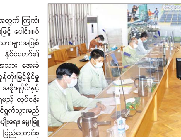
ဦးစီးဌာနများမှ ညွှန်ကြားရေးမှူးချုပ်များ တက်ရောက် ဆွေးနွေးခဲ့ကြသည်။ မြန်မာ့ရေထွက်ပစ္စည်းများကို နိုင်ငံပေါင်း ၄၅ နိုင်ငံသို့ နှစ်စဉ်တင်ပို့လျက်ရှိပြီး အသားကဏ္ဍ အနေဖြင့် လက်ရှိတွင် တိရစ္ဆာန်အရင်များကိုသာ အိမ်နီးချင်းနိုင်ငံသို့ နယ်စပ်ကတစ်ဆင့် အဓိက

နေပြည်တော် စက်တင်ဘာ ၂၂ ပြည်တွင်းစားသုံးမှု ဖူလုံမှုရှိစေရန်အတွက် ကြက်၊ ဝက်များကို ခေတ်မီနည်းစနစ်များဖြင့် ပေါင်းစပ်မွေးမြူရန်နှင့် ပြည်ပသို့ အေးခဲအသားများအဖြစ် တင်ပို့နိုင်ရေး ဆောင်ရွက်သွားရန် နိုင်ငံတော်၏ လမ်းညွှန်မှုနှင့်အညီ လက်ရှိ ငါး/အသား အေးခဲတင်ပို့မှုအခြေအနေနှင့် ပြည်ပပို့ကုန်တိုးမြှင့်နိုင်မှု အလားအလာများကိုသုံးသပ်၍ အစိုးရပိုင်းနှင့် ပုဂ္ဂလိကကဏ္ဍများက ဆောင်ရွက်ရမည့် လုပ်ငန်းအစီအစဉ် Action Plan ရေးဆွဲဆောင်ရွက်သွားမည် ဖြစ်ကြောင်း ယနေ့နံနက်ပိုင်းက စိုက်ပျိုးရေး၊ မွေးမြူရေးနှင့် ဆည်မြောင်းဝန်ကြီးဌာန ပြည်ထောင်စုဝန်ကြီးရှုံး၌ ကျင်းပသည့် တိရစ္ဆာန်၊ အသား၊ ငါးကဏ္ဍ ပို့ကုန်မြှင့်တင်ရန် Action Plan ရေးဆွဲဆောင်ရွက်ရေး လုပ်ငန်းညှိနှိုင်းအစည်းအဝေးတွင် ဒုတိယဝန်ကြီး ဒေါက်တာအောင်ကြီးက ပြောကြားသည်။