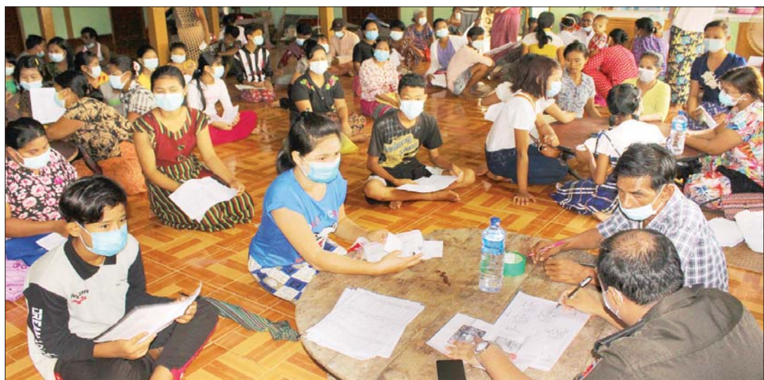
ဒလမြို့နယ် တာကြီးရပ်ကွက်ရှိ လာဘာမှန်ပြည်လုံးချမ်းသာ ဆုတောင်းပြည့်စေတီတော် ဓမ္မာရုံ၌ ဒေသခံများအား နိုင်ငံသားစိစစ်ရေးကတ်ပြားနှင့် အိမ်ထောင်စုလူဦးရေစာရင်းများ ပြုလုပ်ပေးစဉ်။