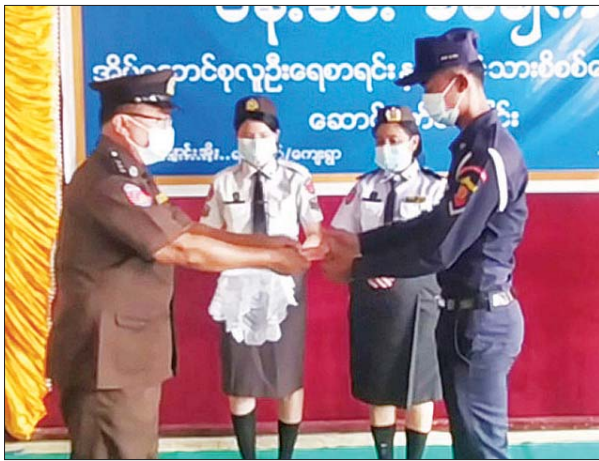
ကတ်များ ပြုလုပ်ဆောင်ရွက်ပေးရန် လျာထားပြီး ပြည်မြို့နယ်တွင် အခုရေ ၉၈၀ ဆောင်ရွက်ပေးယနေ့ ဆောင်ရွက်မှုအပါအဝင် ခဲ့ပြီးဖြစ်ကြောင်း သိရသည်။ အိမ်ထောင်စုလူဦးရေစာရင်း ၈၁၀ ကိုဆက်