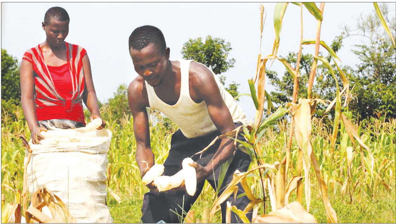
ပြောင်းဖူးများကို အိတ်ထဲထည့်နေသော ကင်ညာလယ်သမားအချို့ကို တွေ့ရစဉ်။

စားနပ်ရိက္ခာထောက်ပံ့မှုကို အသည်းအသန်လိုအပ်ခြောက်သွေ့တဲ့ မိုးခေါင်ဒေသနဲ့ တချို့တစ်ဝက်ခြောက်သွေ့တဲ့ မိုးခေါင်ဒေသ ၂၃ ခုမှာနေတဲ့ ကင်ညာ ပြည်သူ ၁ ဒသမ ၄ သန်းဟာ စားနပ်ရိက္ခာထောက်ပံ့မှုကို အသည်းအသန်လိုအပ်နေတယ်လို့ ကင်ညာတာဝန်ရှိသူတွေက ဖေဖော်ဝါရီလမှာ ပြောခဲ့ပါတယ်။ နှစ်ရာသီဆက်တိုက် မိုးခေါင်ရောဂါ