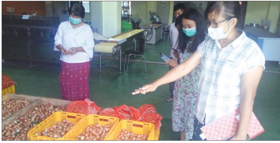
ကြက်သွန်နီကို သိုလှောင်ခြင်းနှင့်ပတ်သက်၍ သုတေသနပြုလုပ်နေစဉ်။

နေပြည်တော် စက်တင်ဘာ ၂၂ နေပြည်တော် ဧပျာသီရိမြို့နယ် ရေဆင်းနယ်မြေတွင် တည်ရှိသည့် ရိတ်သိမ်းချိန်လွန်နည်းပညာဌာန (PHRI) ၌ ခေတ်မီဓာတ်ခွဲခန်း ၁၀ ခုဖြင့် သုတေသနလုပ်ငန်းများ ဆောင်ရွက်လျက်ရှိရာ စိုက်ပျိုးထုတ်လုပ် တင်ပို့ရောင်းချသူများအတွက် နည်းပညာများ ဖြန့်ဝေပေးနေကြောင်းနှင့် အဆိုပါနည်းပညာများကို လေ့လာချင်သူများအနေဖြင့် ရုံးအမှတ်(၁၅)ရှိ စိုက်ပျိုးရေးဦးစီးဌာန(ရုံးချုပ်)သို့ လာရောက်ဆက်သွယ်နိုင်ကြောင်း ဒုတိယညွှန်ကြားရေးမှူး ဒေါက်တာ လှလှမြင့်ထံမှ သိရသည်။ “စိုက်ပျိုးရေးဦးစီးဌာနနဲ့ ကိုရီးယား အပြည်ပြည်ဆိုင်ရာ ပူးပေါင်းဆောင်ရွက်ရေး အေဂျင်စီတို့ ပူးပေါင်းဆောင်ရွက်တာ ဖြစ်ပါတယ်။ ဒီမှာ အဓိက ရိတ်သိမ်းချိန်လွန်နည်းပညာနဲ့ ပတ်သက်တဲ့ ရိတ်သိမ်းချိန်လွန် နည်းပညာဆိုင်ရာ သုတေသနလုပ်ငန်းတွေ ဆောင်ရွက်နေတာဖြစ်သလို ဘေးအန္တရာယ် ကင်းရှင်းပြီး အရည်အသွေး ပြည့်ဝကောင်းမွန်တဲ့ထုတ်ကုန်တွေ ဈေးကွက်မှာ ရောင်းချဖို့နဲ့ ဖြန့်ဖြူးနိုင်ဖို့ စားသုံးသူတွေ ကျန်းမာရေး လူမှုဘဝသဘာဝရေးရာရရှိနိုင်ဖို့ အဓိက ရည်မှန်းချက်ကြီးနဲ့ ဆောင်ရွက်နေတာ ဖြစ်ပါတယ်။ ဒီလိုဆောင်ရွက်တဲ့အခါမှာ ရိတ်သိမ်းချိန်လွန် နည်းပညာလုပ်ငန်းတွေ ဖွံ့ဖြိုးပြီး ဒီဌာနမှာရှိတဲ့ ဝန်ထမ်းတွေရဲ့ စွမ်းဆောင်ရည်မြှင့်တင်နိုင်ဖို့၊ ရိတ်သိမ်းချိန်လွန် ကိုင်တွယ်နည်းစနစ်တွေ ခေတ်မီနည်းပညာတွေ ဖွံ့ဖြိုးတိုးတက်လာစေဖို့၊ နောက် ဒီလိုရိတ်သိမ်းချိန်လွန်နည်းပညာ အသိပညာ တိုးတက်လာမယ်ဆိုရင် လယ်ယာထွက်ကုန် တွေ လေလွင့်ဆုံးရှုံးမှု လျော့နည်းလာပါမယ်။ ဒီအတွက်ရည်မှန်းပြီး ဆောင်ရွက်နေတာ ဖြစ်ပါ