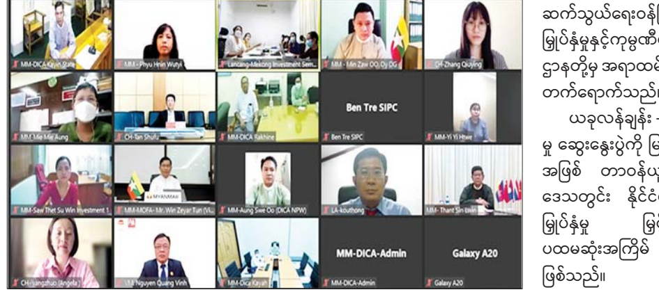
ယခုလန်ချန်း - မဲခေါင် ရင်းနှီးမြှုပ်နှံမှု ဆွေးနွေးပွဲကို မြန်မာနိုင်ငံက အိမ်ရှင်အဖြစ် တာဝန်ယူကျင်းပခဲ့ခြင်းဖြစ်ပြီး ဒေသတွင်း နိုင်ငံများအကြား ရင်းနှီးမြှုပ်နှံမှု မြှင့်တင်နိုင်ရေးအတွက် ပထမဆုံးအကြိမ် ဆွေးနွေးပွဲလည်း ဖြစ်သည်။ သတင်းစဉ်