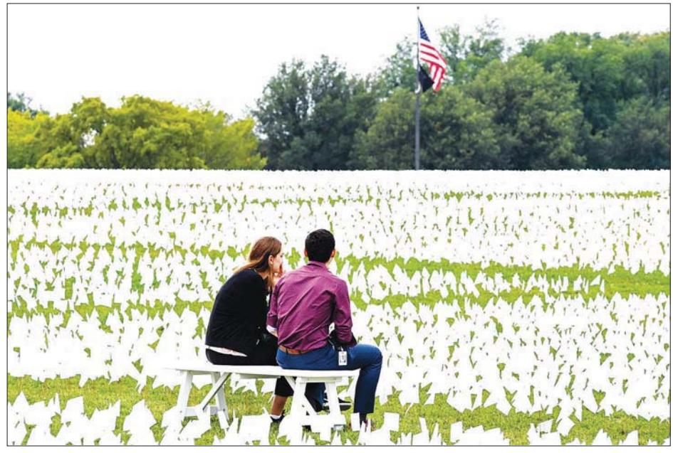
ကိုဗစ်-၁၉ ကြောင့် သေဆုံးသွားသူများအတွက် အလံဖြူ ခြောက်သိန်းကျော် ထောင်ထားမှုကို တွေ့ရစဉ်။