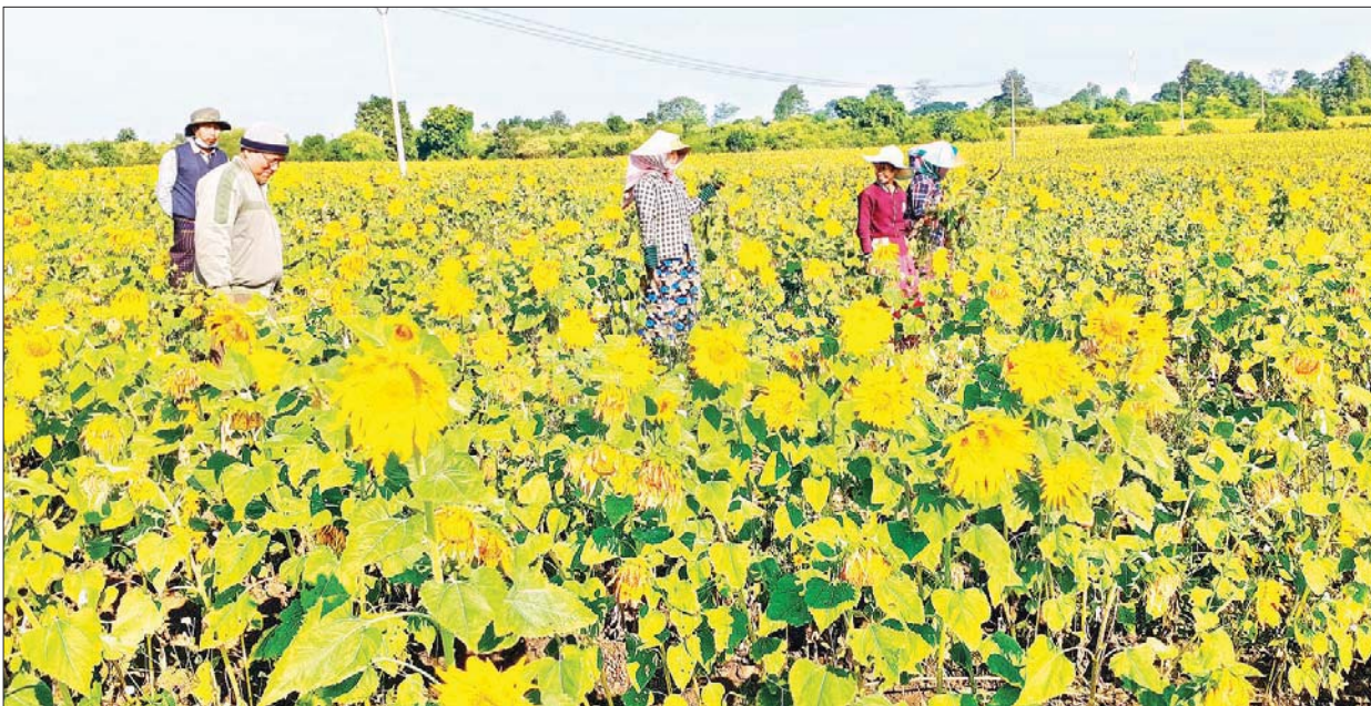
နေကြာသီးနှံမျိုးစေ့ထုတ်စိုက်ခင်းကို တွေ့ရစဉ်။