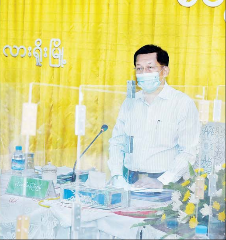
နိုင်ငံတော်စီမံအုပ်ချုပ်ရေးကောင်စီဥက္ကဋ္ဌ၊ နိုင်ငံတော်ဝန်ကြီးချုပ် ဗိုလ်ချုပ်မှူးကြီး မင်းအောင်လှိုင် ရှမ်းပြည်နယ်အစိုးရအဖွဲ့ဝင်များ၊ ကိုယ်ပိုင်အုပ်ချုပ်ခွင့်ရတိုင်း၊ ဒေသများမှ တာဝန်ရှိသူများ၊ ဌာနဆိုင်ရာဝန်ထမ်းများ၊ ခရိုင်၊ မြို့နယ်စီမံအုပ်ချုပ်ရေးအဖွဲ့ဝင်များနှင့် မြို့မိမြို့ဖများအား တွေ့ဆုံအမှာစကား ပြောကြားစဉ်။

နေပြည်တော် စက်တင်ဘာ ၁၉ ရှိသူများ၊ ဌာနဆိုင်ရာဝန်ထမ်းများ၊ ခရိုင်၊ မြို့နယ်စီမံအုပ်ချုပ်ရေးအဖွဲ့ဝင်များနှင့် မြို့မိမြို့ဖများအား လားရှိုးမြို့ရှိ ရှမ်းပြည်နယ်အစိုးရအဖွဲ့ခွဲရုံး အစည်းအဝေးခန်းမ၌ တွေ့ဆုံအမှာစကား ပြောကြားသည်။ စာမျက်နှာ ၃ ကော်လံ ၁ *