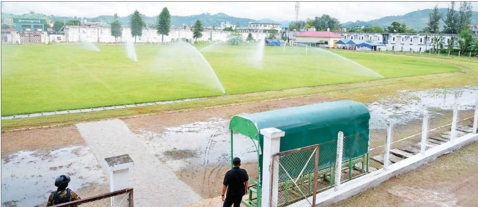
နိုင်ငံတော် စီမံအုပ်ချုပ်ရေး ကောင်စီဥက္ကဋ္ဌ၊ နိုင်ငံတော် ဝန်ကြီးချုပ် ဗိုလ်ချုပ်မှူးကြီး မင်းအောင်လှိုင်နှင့် အဖွဲ့ဝင် များ လားရှိုးမြို့ ခရိုင် အားကစားကွင်းအား ကြည့်ရှု စစ်ဆေးစဉ်။

တက်ရောက်ကြသည်။ ရှင်းလင်းတင်ပြ ဦးစွာ နိုင်ငံတော်စီမံအုပ်ချုပ်ရေးကောင်စီဥက္ကဋ္ဌ၊ နိုင်ငံတော်ဝန်ကြီးချုပ်နှင့် အဖွဲ့ဝင်များအား ရှမ်း ပြည်နယ် ဝန်ကြီးချုပ် ဒေါက်တာ ကျော်ထွန်းနှင့် အဖွဲ့ဝင်များက လိုက်လံနွေးထွေးစွာ ကြိုဆိုနှုတ်ဆက် ကြသည်။ ထို့နောက် ပြည်နယ်ဝန်ကြီးချုပ်က ရှမ်း ပြည်နယ်အတွင်း ဒေသဖွံ့ဖြိုးတိုးတက်ရေး ဆောင်