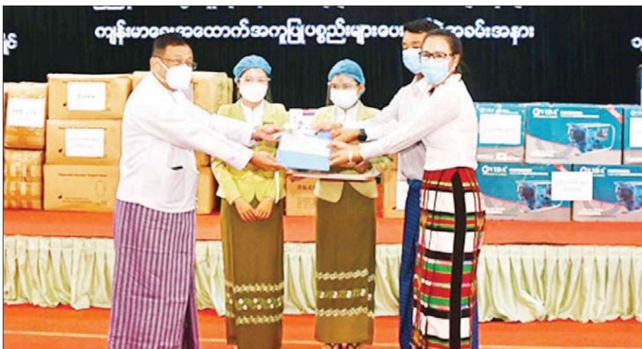
ဝင် ၂၄၀ ထုတ်လုပ်ဖြန့်ဖြူးနေမှု လျှင် အောက်ဆီဂျင် လီတာ ၄၀ များကို တြိဂံဒေသ တိုင်းစစ် ဝင် ၁၄၀ ထုတ်လုပ်နိုင်သည့် အောက်ဆီဂျင်စက် ရောက်ရှိ တပ်ဆင်နေမှုများကို အနောက် တောင်တိုင်းစစ်ဌာနချုပ်မှ တာဝန် ရှိသူများနှင့် ဌာနဆိုင်ရာ တာဝန်ရှိ သတင်းစဉ်

၁၁၀၀တန်ဖိုးရှိ အောက်ဆီဂျင်ဂျန်နရေတာ Plant တစ်လုံးကို ပေးအပ်လှူဒါန်းရာ ပြည်နယ်ဝန်ကြီးချုပ် ဦးဇော်လင်းထွန်းက လက်ခံရယူပြီး ဂုဏ်ပြုမှတ်တမ်းလွှာ ပြန်လည်ပေးအပ်သည်။ ထို့ပြင် တိုင်းဒေသကြီးနှင့် ပြည်နယ်အသီးသီးရှိ အောက်ဆီဂျင် လိုအပ်ချက်များ မရှိစေရေးအတွက် ကျန်းမာရေးဝန်ကြီးဌာနမှ Oxygen Plant များကို တိုးမြှင့်တပ်ဆင် လည်ပတ်လျက်ရှိပြီး တပ်မတော် အနေဖြင့်လည်း တိုင်းစစ်ဌာနချုပ် နယ်မြေအသီးသီးတွင် Oxygen Plant များကို တပ်ဆင်ထုတ်လုပ်ပေးလျက်ရှိရာ ရှမ်းပြည်နယ်အရှေ့ပိုင်း တာချီလိတ်မြို့ရှိ အောက်ဆီဂျင်စက်ရုံမှ တစ်ရက်လျှင် အောက်ဆီဂျင် လီတာ ၄၀