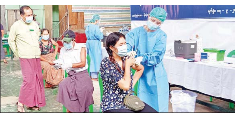
ရောဝတီတိုင်းဒေသကြီး ပုသိမ်ခရိုင် ကျောင်းကုန်းမြို့နယ်အတွင်းရှိ အသက် (၅၅) နှစ်မှ (၆၄)နှစ်အထိ ကိုဗစ်-၁၉ ရောဂါ ကာကွယ်ဆေး ပထမအကြိမ် ထိုးနှံပေးခြင်းကို အမှတ်(၂)ရပ်ကွက် မိုးလုံလေလုံအားကစားခန်းမ၌ စက်တင်ဘာ ၁၉ ရက်က ထိုးနှံပေးစဉ်။ ဝင်းကြိုင်(ပြန်/ဆက်)