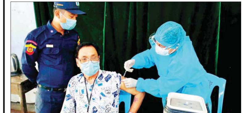
ရခိုင်ပြည်နယ် ကျောက်ဖြူမြို့တွင် အသက် ၅၅ နှစ်နှင့်အထက်ရှိသူများနှင့် ဦးစားပေး အုပ်စုတွင် ပါဝင်သူများအား ကိုဗစ်-၁၉ ရောဂါကာကွယ်ဆေး တတိယအကြိမ်၊ ဒုတိယနေ့အဖြစ် စတင်ထိုးနှံခြင်းကို စက်တင်ဘာ ၁၉ ရက်က အထက(၃)၌ ရပ်ကွက်များအလိုက် ထိုးနှံပေးစဉ်။