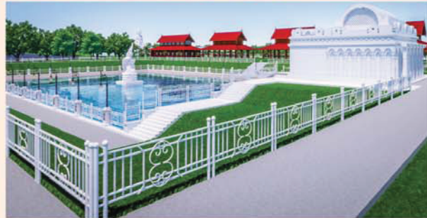
မုဝလိန္ဒာတိုင်

၁။ နိုင်ငံတော်စီမံအုပ်ချုပ်ရေးကောင်စီဥက္ကဋ္ဌ၊ တပ်မတော်ကာကွယ်ရေးဦးစီးချုပ် ဗိုလ်ချုပ်မှူးကြီးမင်းအောင်လှိုင် ဦးဆောင်သည့် (၇)ရက်သား၊ သမီး၊ ဘုရားဒါယကာ၊ ဒါယိကာမတို့က မာရဝိဇယဗုဒ္ဓရုပ်ပွားတော်မြတ်ကြီးအား မြန်မာနိုင်ငံတွင် ထေရဝါဒဗုဒ္ဓသာသနာတော်ထွန်းလင်းတောက်ပလျက်ရှိသည်ကို ကမ္ဘာကိုပြသရန်၊ တိုင်းပြည်အေးချမ်းသာယာမှုရှိစေရန်၊ ရုပ်ပွားတော်မြတ်ကြီးအား ပြည်တွင်း၊ ပြည်ပဘုရားဖူးများလာရောက်ခြင်းဖြင့် ဒေသတိုးတက်စည်ကားမှုကို အထောက်အကူဖြစ်စေရန်၊ နိုင်ငံတော်ဖွံ့ဖြိုးတိုးတက်မှုအား အထောက်အကူ ဖြစ်စေရန်ရည်သန်လျက် ပြည်ထောင်စုနယ်မြေ နေပြည်တော်၊ ဒက္ခိဏသီရိမြို့နယ်အတွင်း၌ သာသနာတော်ထုံး၊ ရုပ်ပွားဆင်းတုတော်ထုံး၊ မြန်မာ့ရိုးရာတည်ထုံးများနှင့်အညီ တည်ဆောက် ပူဇော်လျက်ရှိပါသည်။