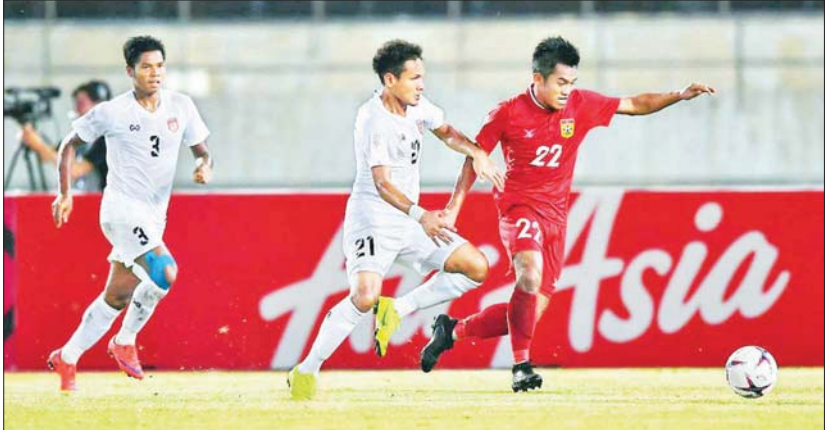
၂၀၁၈ ကျင်းပခဲ့သည့် ဆူဇူကီဖလားပြိုင်ပွဲတွင် မြန်မာနှင့် လာအိုအသင်း ယှဉ်ပြိုင်နေစဉ်။

ယင်းပြိုင်ပွဲကို ပုံမှန်အရ ၂၀၂၀ နှစ်ကုန်ပိုင်း တွင် ကျင်းပရမည်ဖြစ်သော်လည်း ကပ်ရောဂါ ကြောင့် ယခုနှစ်သို့ ရွှေ့ဆိုင်းထားခြင်းဖြစ် သည်။ သို့သော် ၂၀၂၀ အာဆီယံဆူဇူကီဖလား ပြိုင်ပွဲအမည်ဖြင့်သာ ကျင်းပသွားမည်ဖြစ်သည်။ ရဲရင့်လွင်၊ ဓာတ်ပုံ-affsuzukicup.com