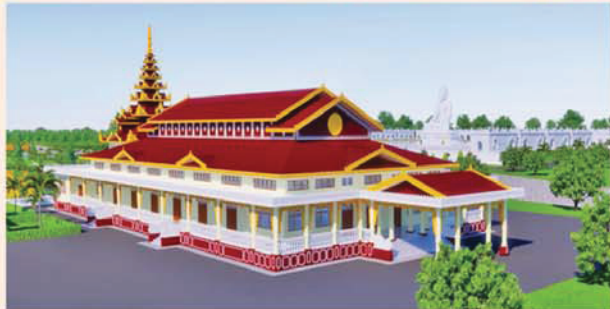
ဓမ္မာရုံ(၂၁၃x၉၀)ပေ ၁ လုံး-၈၇၀၀ သိန်း