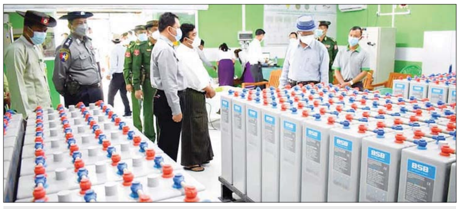
ဧရာဝတီတိုင်းဒေသကြီးဝန်ကြီးချုပ် ဦးတင်မောင်ဝင်း နေရောင်ခြည်စွမ်းအင်သုံး လျှပ်စစ်ဓာတ်အားပေး စက်ရုံကို ကြည့်ရှုစစ်ဆေးစဉ်။

မြန်အောင် စက်တင်ဘာ ၁၉ ဧရာဝတီတိုင်းဒေသကြီး ဝန်ကြီး ချုပ် ဦးတင်မောင်ဝင်းနှင့် အဖွဲ့ သည် ယမန်နေ့နံနက်ပိုင်းက မြန်အောင်မြို့နယ် မျှင်ဝါး တောင်ကျေးရွာ ကွင်းအမှတ် (၃၅၄) တောင်သူဦးသောင်းဌေး၏ မျိုးစေ့ထုတ်ဧက ငါးဧကတွင် ဓာတ်မြေဩဇာ ကြွပတ်ပွဲကို တက်ရောက်အားပေးပြီး စပါးမျိုး စေ့ထုတ် တောင်သူ ၂၀ တို့ကို ဓာတ်မြေဩဇာများ ထောက်ပံ့ပေး အပ်သည်။ ယင်းနောက် ဝန်ကြီးချုပ်နှင့်