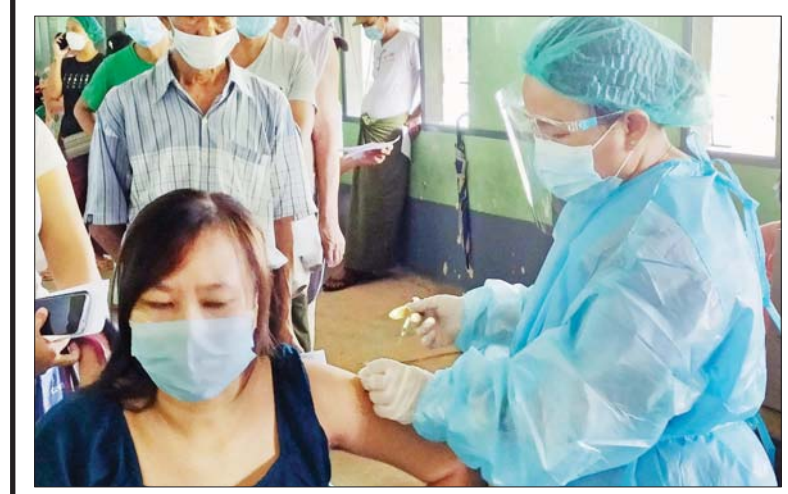
လှည်းကူးမြို့နယ်တွင် အသက် ၅၅ နှစ်နှင့်အထက် ပြည်သူများနှင့် သတ်မှတ်ဦးတည် အုပ်စုတွင် ပါဝင်သူများအား စက်တင်ဘာ ၁၉ ရက်က အ-ထ-က(အင်းတိုင်)တွင် ပထမအကြိမ် ကာကွယ်ဆေး ထိုးနှံပေးစဉ်။ ကျော်ကျော်(ပြန်/ဆက်)