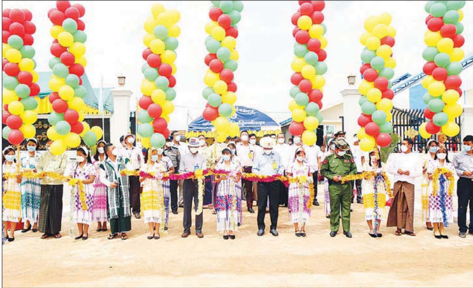
ကရင်ပြည်နယ်ဝန်ကြီးချုပ် ဦးစောမြင့်ဦးနှင့် တာဝန်ရှိသူများက မြဝတီမြို့ အောက်ဆီဂျင်စက်ရုံအား ဖွင့်လှစ်ပေးပေးစဉ်။

ကရင်ပြည်နယ်ဝန်ကြီးချုပ် ဦးစောမြင့်ဦး၊ ပြည်နယ် တရားလွှတ်တော်တရားသူကြီးချုပ် ဦးသိန်းကိုကိုနှင့် ပြည်နယ်အစိုးရအဖွဲ့ဝင် ဝန်ကြီးများသည် ယမန်နေ့က မြဝတီမြို့ အောက်ဆီဂျင်စက်ရုံအား ဖွင့်လှစ်ပေးပြီး ဒေသဖွံ့ဖြိုးရေးလုပ်ငန်း ဆောင်ရွက် မှုများကို ကွင်းဆင်းစစ်ဆေးသည်။