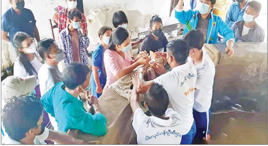
ငါးဆေးထိုးခြင်းကို လက်တွေ့ဆောင်ရွက်နေစဉ်။