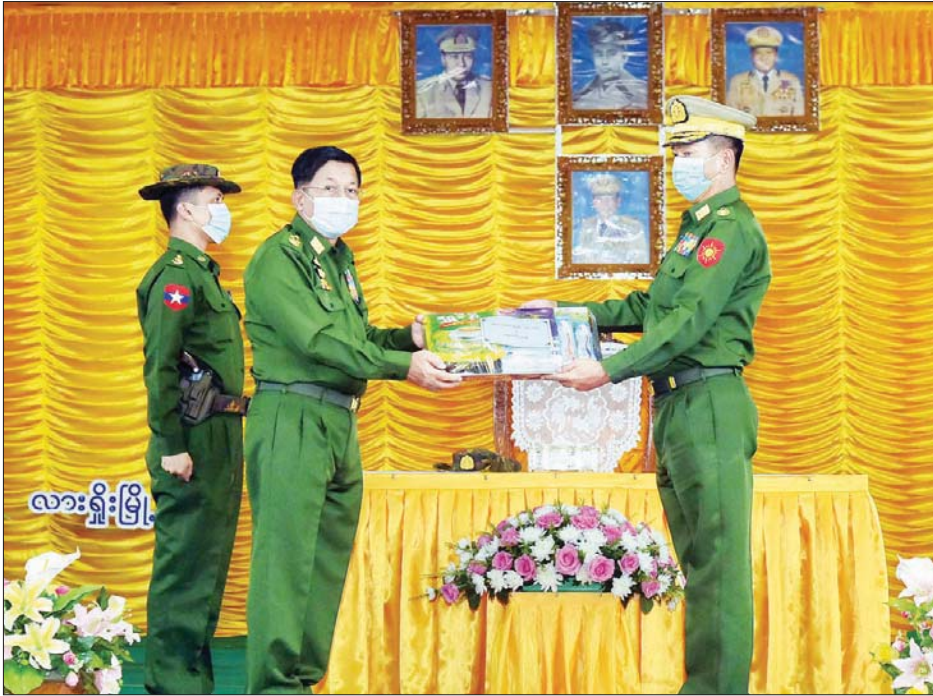
နိုင်ငံတော်စီမံအုပ်ချုပ်ရေးကောင်စီဥက္ကဋ္ဌ၊ တပ်မတော်ကာကွယ်ရေးဦးစီးချုပ် ဗိုလ်ချုပ်မှူးကြီး မင်းအောင်လှိုင် စားသောက်ဖွယ်ရာများကို တိုင်းမှူးထံ ပေးအပ်စဉ်။