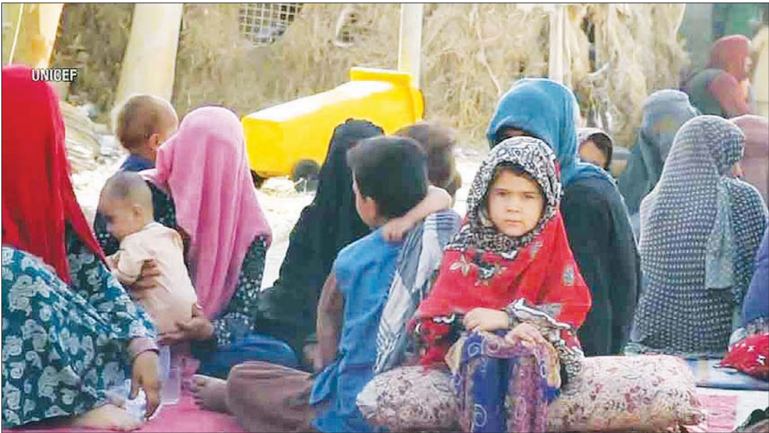
ခိုလှုံရေးစခန်းရှိ ကလေးငယ်တစ်ဦးကို တွေ့ရစဉ်။

ဒုက္ခသည် ခိုလှုံရေးစခန်းတွေမှာ ကလေးတွေရှိတယ်။ ကျောင်းပြင်ပ ရောက်နေတဲ့ ကလေးတွေလည်း ရှိ တယ်။ အစားအသောက် မစားရတဲ့ ကလေးတွေလည်းရှိတယ်။ ဆေးဝါး