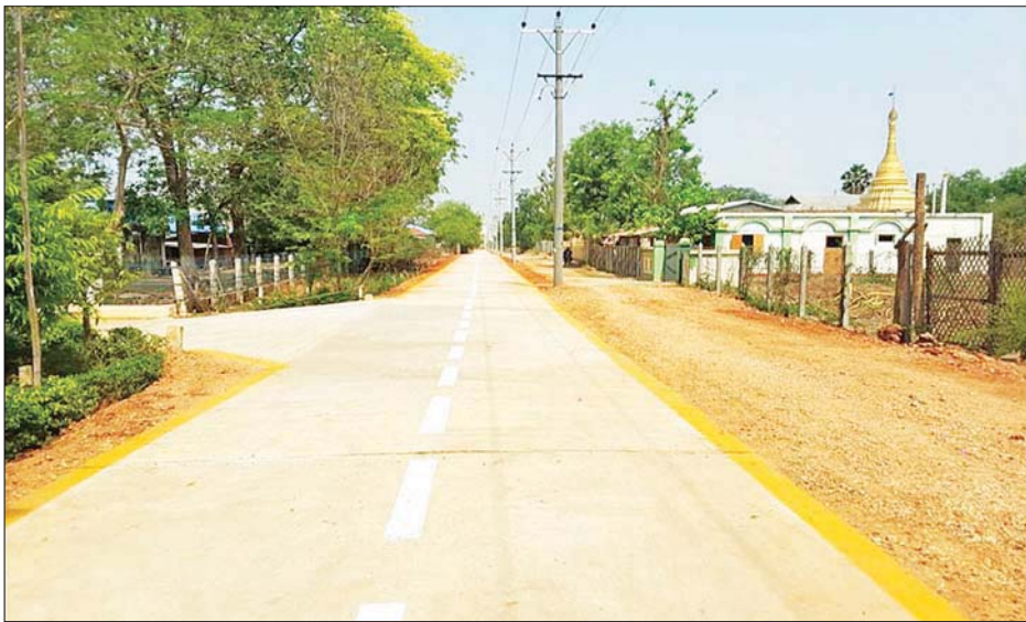
ရေစကြိုမြို့နယ် ရွာသာကျေးရွာ ကွန်ကရစ်ခင်းခြင်း ဆောင်ရွက်ပြီးမှုပုံ။