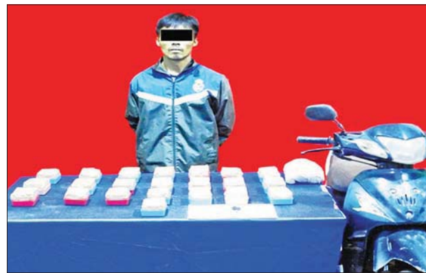
အိုက်ပွင့် အားသိမ်းဆည်းရမိသည့် ဘိန်းဖြူများနှင့်အတူ တွေ့ရစဉ်။

မူးယစ်ဆေးဝါး တားဆီးနှိမ်နင်းရေး ရဲတပ်ဖွဲ့မှ တပ်ဖွဲ့ဝင်များပါဝင်သော ပူးပေါင်းအဖွဲ့သည် စက်တင်ဘာ ၁၈ ရက် မွန်းလွဲ ၂ နာရီတွင် မြစ်ကြီးနား