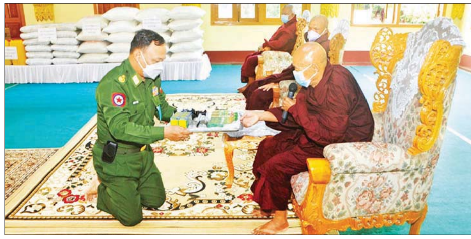
နေပြည်တော်တိုင်းစစ်ဌာနချုပ် တိုင်းမှူး ဗိုလ်ချုပ်ဇော်ဟိန်း တပ်ကုန်းမြို့ ငွေတောင်တော်ရ ပရိယတ္တိ စာသင်တိုက် ဆရာတော်ထံ အလှူငွေများ ဆက်ကပ်လှူဒါန်းစဉ်။

ရှင်စာသင်တိုက်များနှင့် တပ်ကုန်းမြို့ တိုးတိုးရိပ်သာသို့တပ်မတော် (ကြည်း၊ ရေ၊ လေ)မိသားစုများနှင့် စေတနာရှင် ပြည်သူများက စုပေါင်းလှူဒါန်းသည့် အလှူငွေကျပ် ၁၃၀၅၄၅၀၀၊ ဆန် ၃၆၅ အိတ် ၁၆ ပြည်၊ ဆီ ပိသာ ၁၀၉ ဒသမ ၇၀၊ ပဲ ၁၀၉၇ ပိသာ၊ ဆား ၁၀၉၇ ပိသာ၊ လက်သန့်ဆေးရည် ၁၀၉၇ ဘူးနှင့် ဆေးမျိုးစုံ ၁၅၄ ဘူးတို့ကို နေပြည်တော် တိုင်းစစ်ဌာနချုပ် တိုင်းမှူး ဗိုလ်ချုပ်ဇော်ဟိန်းနှင့် အဖွဲ့ဝင်များက ငွေတောင်တော်ကျောင်း တိုက်သို့သွားရောက်၍ ဆရာတော် ဘဒ္ဒန္တဝိဇ္ဇေတက အမှူးပြုသော သံဃာတော်များထံ ဆက်ကပ်လှူဒါန်းသည်။ ထို့နောက် နယ်မြေခံတပ်မတော် သားများက သက်ဆိုင်ရာ ဘုန်းတော်ကြီး