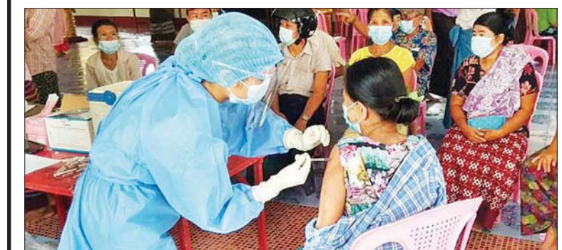
ပဲခူးတိုင်းဒေသကြီး နတ်တလင်းမြို့နယ်တွင် ကိုဗစ်-၁၉ ရောဂါ ကာကွယ်ဆေး ဒုတိယအကြိမ်ကို ဦးစားပေးအစီအစဉ်အလိုက် စက်တင်ဘာ ၁၅ ရက်မှ စတင်ကာ ထိုးနှံပေးလျက်ရှိရာ ဆေးမထိုးရသေးသည့်သူများကို သတ်မှတ်စုရပ်များတွင် ထိုးနှံပေးစဉ်။ ဝေယံဖြိုး(ပြန်/ဆက်)