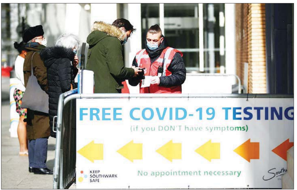
ဗြိတိန်နိုင်ငံ လန်ဒန်မြို့တွင် ကိုဗစ် -၁၉ စစ်ဆေးရေးစင်တာရှေ့၌ တန်းစီနေကြသူများကို တွေ့ရစဉ်။

လန်ဒန် စက်တင်ဘာ ၁၉ ဗြိတိန်နိုင်ငံတွင် ကိုဗစ် -၁၉ ကူးစက်ခံရသူ ၃၀၁၄၄ ဦး ထပ်မံ တွေ့ရှိခဲ့ရာ စုစုပေါင်းကူးစက်ခံရ သူအရေအတွက်မှာ ၇၄၀၀၇၃၉ ဦး ရှိလာသည်ဟု စက်တင်ဘာ ၁၈ ရက်တွင် အာဏာပိုင်များက တရားဝင် သတင်းထုတ်ပြန် သည်။ နိုင်ငံအတွင်း ကိုဗစ် -၁၉ နှင့် ဆက်စပ်ပြီး သေဆုံးသူ အရေ အတွက်မှာ ၁၆၄ ဦးရှိပြီး စုစုပေါင်း သေဆုံးသူ အရေအတွက်မှာမူ ၁၃၅၁၄၄ ဦး ရှိသည်။ ဗြိတိန်နိုင်ငံတွင် အသက် ၁၆ နှစ်နှင့်အထက် ကိုဗစ်-၁၉ ကာကွယ်ဆေး ပထမအကြိမ် ထိုးပြီးသူ ၈၉ ရာခိုင်နှုန်းရှိပြီး ကာကွယ်ဆေး အပြည့်ထိုးပြီးသူ အရေအတွက်မှာ ၈၁ ရာခိုင်နှုန်း ရှိသည်ဟု နောက်ဆုံးထုတ်ပြန် ထားသည့် အချက်အလက်များ အရ သိရသည်။ ဆင်ဟွာ