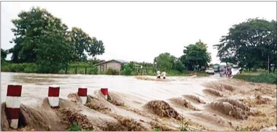
မိုးရွာသွန်းမှုကြောင့် ရွှေဘို-မြစ်ကြီးနားကားလမ်းပေါ် ရေကျော်နေမှုကို တွေ့ရစဉ်။

အလားတူ နန့်သဲကျေးရွာအနီးနှင့် နားခေါင်ကျေးရွာအနီး ရွှေဘို-မြစ်ကြီးနား ကားလမ်းပေါ်သို့ တောင်ကျချောင်းရေများ စီးဆင်းပြီး ရေကြီးရေလျှံမှုဖြစ်ကာ အတက်အဆင်း မော်တော်ယာဉ်များ ရေကျသည်အထိ စောင့်ဆိုင်းနေခဲ့ရကြောင်း သိရသည်။ အဆိုပါ ရေကြီးရေလျှံသည့်နေရာသို့ အင်းတော်မြို့နယ်ရှိ ဌာနဆိုင်ရာများ၊ မီးသတ်တပ်ဖွဲ့ဝင်များနှင့် ပရဟိတလူမှုရေးအသင်းအဖွဲ့များက လိုအပ်သည်များ သွားရောက်ကူညီဆောင်ရွက်ပေးကြောင်းသိရသည်။ ခင်မောင်ဆွေ (မော်လူး)