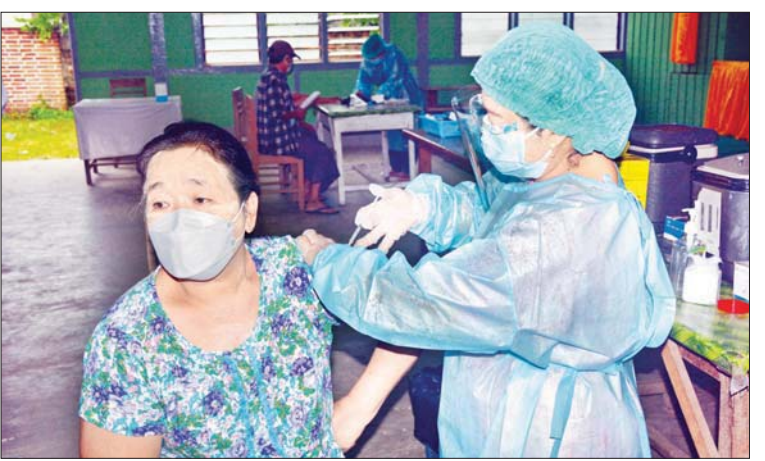
မိုးမိတ်မြို့နယ်တွင် ကိုဗစ်-၁၉ ရောဂါ ကာကွယ်ဆေး မထိုးရသေးသော အသက်(၅၅) နှစ်နှင့်(၆၄)နှစ်ကြား ရဟန်းသံဃာများနှင့် ဒေသခံတိုင်းရင်းသားများအား ပထမနေ့ အဖြစ် စက်တင်ဘာ ၁၉ ရက်က စုရပ်၌ ထိုးနှံပေးစဉ်။ မိုးမိတ်သား(ပြန်/ဆက်)