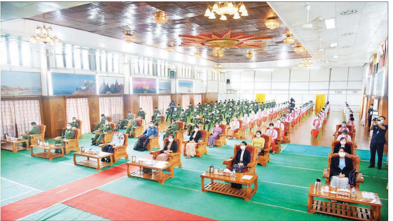
နိုင်ငံတော်စီမံအုပ်ချုပ်ရေးကောင်စီဥက္ကဋ္ဌ၊ တပ်မတော်ကာကွယ်ရေးဦးစီးချုပ် ဗိုလ်ချုပ်မှူးကြီး မင်းအောင်လှိုင် လားရှိုးတပ်နယ်ရှိ အရာရှိ၊ စစ်သည်၊ မိသားစုများအား တွေ့ဆုံအမှာစကား ပြောကြားစဉ်။