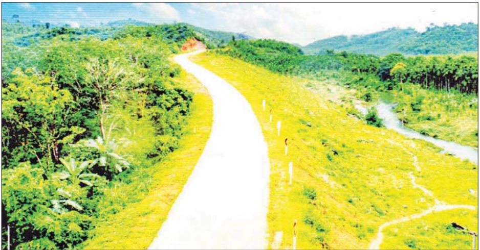
လေညှာ-ရတနာပုံလမ်းကွန်ကရစ်ခင်းထားမှုကို တွေ့ရစဉ်။