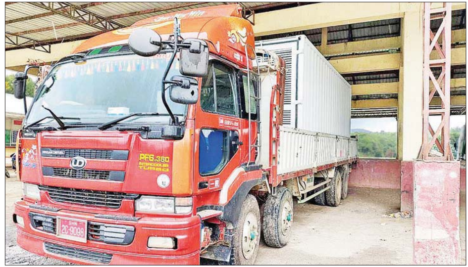
မူဆယ်နယ်စပ်ကုန်သွယ်ရေးစခန်းမှ ကိုဗစ်-၁၉ ရောဂါ ထိန်းချုပ် ကုသရေးဆိုင်ရာ ပစ္စည်းများ တင်သွင်းလာစဉ်။

နေပြည်တော် စက်တင်ဘာ ၁၉ စီးပွားရေးနှင့် ကူးသန်းရောင်းဝယ်ရေးဝန်ကြီးဌာန အနေဖြင့် ကိုဗစ်-၁၉ ရောဂါ ကာကွယ်၊ ထိန်းချုပ်၊ ကုသရေးဆိုင်ရာပစ္စည်းများကို လေကြောင်း၊ ရေကြောင်းနှင့် နယ်စပ်ကုန်သွယ်ရေးစခန်းများမှ အဆင်ပြေချောမွေ့စွာ တင်သွင်းနိုင်ရေးအတွက် အချိန်နှင့်တစ်ပြေးညီ စီစဉ်ဆောင်ရွက်ပေးလျက်ရှိသည်။ ထိုသို့ ဆောင်ရွက်ပေးလျက်ရှိရာ ယနေ့တွင် ရန်ကုန်အပြည်ပြည်ဆိုင်ရာလေဆိပ်နှင့် ဖြဝတီ၊ မူဆယ်၊ ချင်းရွှေဟော်၊ ကန်ပိုက်တီး နယ်စပ်စခန်းလေးခုတို့မှ တင်သွင်းရာ၌ ကုမ္ပဏီ ၁၀ ခုမှ ယာဉ်စီးရေ ၁၂ စီးဖြင့် အောက်ဆီဂျင် (အိုးခွဲ) ၈၀၀၊ Oxygen Plant လေးခု၊ အိမ်သုံး Oxygen Concentrator ၄၁ ခု၊ PPE ဝတ်စုံ ၂၈၀၀ နှင့် နှာခေါင်းစည်း (Mask) ၁၇