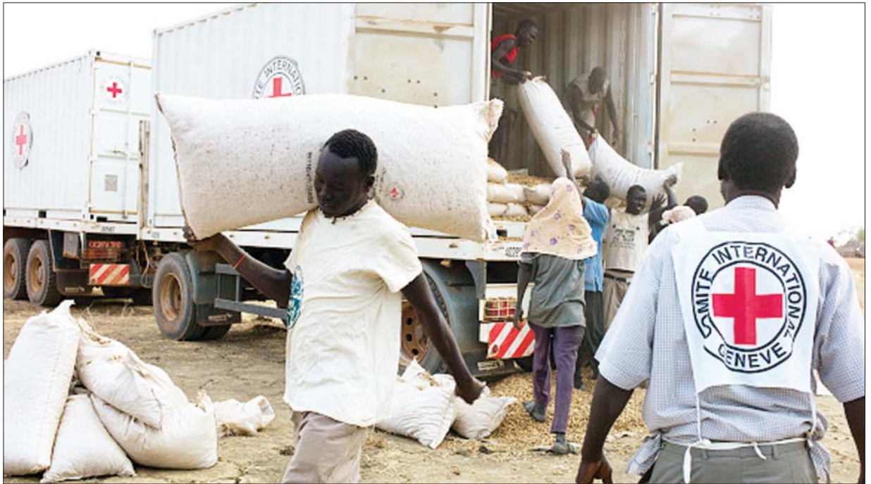
တောင်ဆူဒန် အတွက်အနီးရှိ ကျေးရွာများသို့ အပြည်ပြည်ဆိုင်ရာ ကြက်ခြေနီကော်မတီက မျိုးစေ့၊ စိုက်ပျိုးရေးပစ္စည်းများနှင့် စားနပ်ရိက္ခာများ ဝေငှပေးနေစဉ်။

အဲဒီလို လုပ်လိုက်တဲ့အကျိုးဆက်ကြောင့် အခြေခံစားသောက်ကုန်