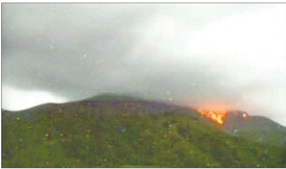
မီးတောင်ပေါက်ကွဲမှု အခြေအနေကို တွေ့ရစဉ်။

ဒဏ်ရာရရှိသူ အရေအတွက်ကို မသိရသေးပေ။ ဂျပန်မိုးလေဝသအေဂျင်စီက သတိပေးမှုအဆင့်ကို အဆင့်သုံးအထိထုတ်ပြန်ထားပြီး လူများမီးတောင် အနီး သို့ ချဉ်းကပ်ခွင့်မပြုပေ။ ပေါက်ကွဲမှုအရှိန်ကြောင့် ကျောက်တုံးကြီးများ လွင့်စဉ်လာနိုင်မှုအခြေအနေကိုလည်း သတိပေးထား သည်။ စက်တင်ဘာ ၁၆ ရက်ကတည်းက မီးတောင် အဝတွင် ပေါက်ကွဲမှုများ ပေါ်ပေါက်ခဲ့သည်ဟု အေဂျင်စီက ပြောသည်။ ဝန်ကြီးချုပ်ရုံးတွင်လည်း ဆက်သွယ်ရေး အရာရှိရုံးကို တည်ထောင်ထားပြီး သတင်းအချက် အလက်များ စုဆောင်းလျက်ရှိသည်။ ဆူဝန်နီဆီ ကျွန်းသည် မီးတောင်ကျွန်းဖြစ်ပြီး လူဦးရေ ၁၀၀ ထက်မနည်း နေထိုင်သည်။