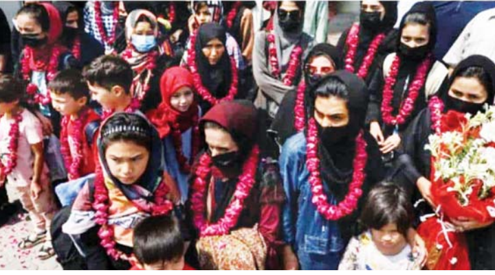
ပါကစ္စတန်သို့ရောက်ရှိလာသည့် အာဖဂန်အမျိုးသမီးဘောလုံးအသင်းသားများကိုတွေ့ရစဉ်။ သည်။ အမျိုးသမီးများ အားကစားပြိုင်ပွဲ တာလီဘန်အဆင့်မြင့်အရာရှိတစ်ဦးက တွင်ပါဝင်ယှဉ်ပြိုင်ရန် မလိုအပ်ဟု ဩစတြေးလျမီဒီယာသို့ ပြောသည်။

ကျော်လာသူ စုစုပေါင်း ၇၅ ဦးရှိပြီး လာဟိုးမြို့သို့မရောက်မီ ၎င်းတို့ကိုပန်းကုံးများဖြင့်ကြိုဆိုခဲ့ကြသည်။ ထွက်ပြေးလာသူအမျိုးသမီးဘောလုံးအသင်းသားများမှာ အသက် ၁၄နှစ်အောက်၊ ၁၆နှစ်အောက်နှင့် ၁၈နှစ်အောက်တို့ဖြစ်ကြသည်။ အာဖဂန်နစ္စတန်ကိုချုပ်ကိုင်ထားသည့်တာလီဘန်များသည် ၁၉၉၀ ပြည့်နှစ် ၎င်းတို့လွှမ်းမိုး အုပ်ချုပ်စဉ်ကတည်းက အမျိုးသမီးများနှင့် မိန်းကလေးများကို အားကစားပြုလုပ်ခွင့်ကန့်သတ်ထား