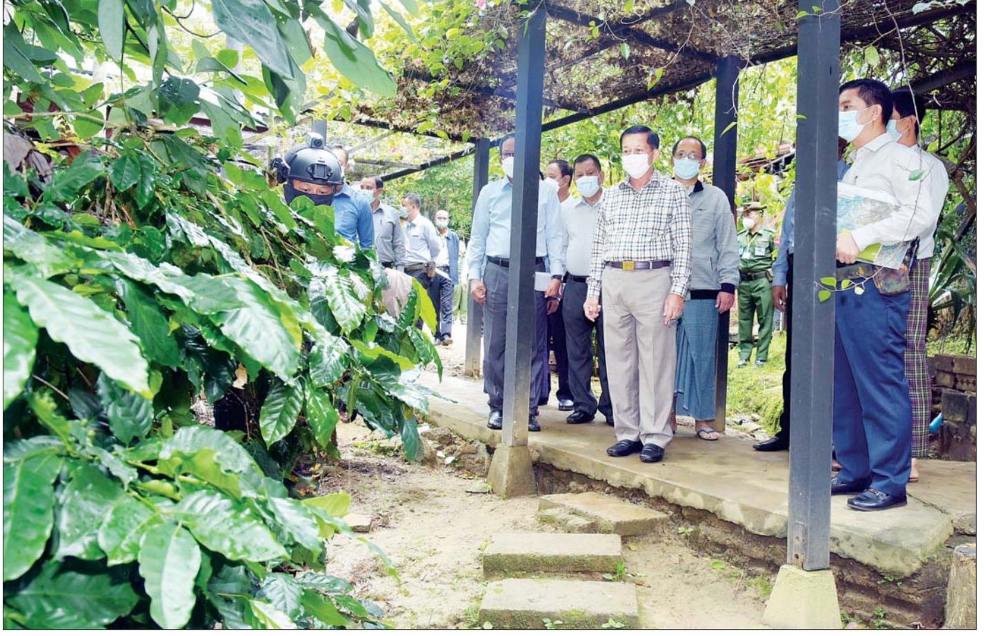
နိုင်ငံတော်စီမံအုပ်ချုပ်ရေးကောင်စီဥက္ကဋ္ဌ၊ နိုင်ငံတော်ဝန်ကြီးချုပ် ဗိုလ်ချုပ်မှူးကြီး မင်းအောင်လှိုင် ပြင်ဦးလွင်မြို့ မြို့ရှောင်လမ်းအနီးရှိ Sithar Coffee Co.,Ltd ကော်ဖီခြံအတွင်း ကြည့်ရှုလေ့လာစဉ်။

“ပြင်ဦးလွင်မြို့သည် မြို့တည်သက်တမ်း နှစ်ပေါင်း ၁၀၀ ကျော်ရှိပြီး သမိုင်းကြောင်းအစဉ်အလာရှိသည့် မြို့ဖြစ်သည်နှင့်အညီ မြို့၏အဆင့်ဂုဏ်သိက္ခာနှင့် လျော်ညီသည့် အားကစားကွင်းတစ်ခုဖြစ်စေရေး၊ ပရိသတ်များ အဆင့်မီကြည့်ရှုနိုင်ရေး၊ အားကစားသမားများ အရည်အသွေးပြည့်မီစွာ လေ့ကျင့်နိုင်စေရေး အားကစားကွင်းများတွင် ရှိသင့်ထိုက်သည့် စံနှုန်းများနှင့်အညီ ထည့်သွင်းတွက်ချက် အဆင့်မြှင့်တင်ရန်လို”