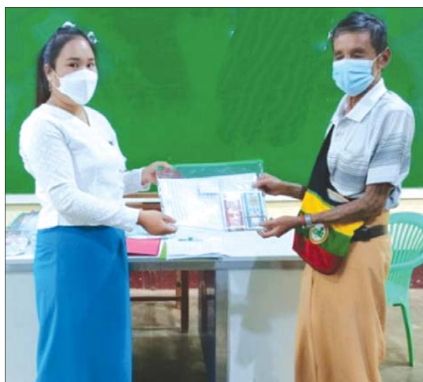
လေလံတင်ရောင်းချရေးအဖွဲ့ နေပြည်တော်စည်ပင်သာယာရေးကော်မတီ

မိုင်းရှူး စက်တင်ဘာ ၁၇ ရှမ်းပြည်နယ်တောင်ပိုင်း မိုင်းရှူးမြို့နယ်အတွင်းမှ ကိုယ်ဝန်ဆောင်မိခင်နှင့် အသက်နှစ်နှစ်အောက် ကလေးငယ်များအတွက် လူမှုဝန်ထမ်းဦးစီးဌာနက ထောက်ပံ့သည့် ထောက်ပံ့ငွေများကို စက်တင်ဘာ ၁၅ ရက်မှစ၍ ရပ်ကွက်/ကျေးရွာအလိုက် ပေးအပ်လျက်ရှိကြောင်း သိရသည်။