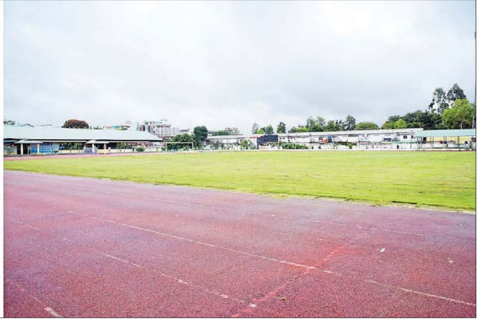
နိုင်ငံတော်စီမံအုပ်ချုပ်ရေးကောင်စီဥက္ကဋ္ဌ၊ နိုင်ငံတော်ဝန်ကြီးချုပ် ဗိုလ်ချုပ်မှူးကြီး မင်းအောင်လှိုင် ပြင်ဦးလွင်ခရိုင် အားကစားလေ့ကျင့်ရေးစခန်း၌ အားကစားကွင်း အဆင့်မြှင့်တင်ခြင်းလုပ်ငန်းဆောင်ရွက်နေမှုကို ကြည့်ရှုစစ်ဆေးစဉ်။