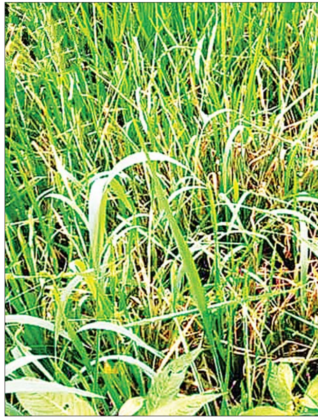
နေ၍တောင်သူများက ဦးထုတ်ရွက် တိုက်ဖျက်နေကြကြောင်း သိရ ဖျန်းဆေးတစ်မျိုးကို အသုံးပြု၍ လှိုင်ဘွား (ဗန်းမောက်)

နည်းပါးမှု၊ စိုထိုင်းဆများပြားမှုတို့ ကြောင့်ဖြစ်ပြီး ညအပူချိန်နိမ့်ကျ နေမှုတို့ကလည်း ရောဂါကို ပြင်းထန်စေကာ စပါးပင် အရွက် များတွင်အစက်ပြောက် သေးသေး လေးမှ အကွက်များဖြစ်ပေါ်လာပြီး အရွက်ခြောက်သွားကာ စပါးပင် ငုတ်တိုတစ်ထွာခန့်သာ ကျန် တော့ကြောင်း၊ ထိုရောဂါပိုး ကျရောက်နေချိန်တွင် ပုလဲမြေဩ ဇာကိုထည့်၍ မရနိုင်ကြောင်း ပိုတက်/စက်ဖြာတို့ကိုသာ ထည့် သွင်းသင့်ကြောင်း အကြံပြု ရေးသားထားသည်။ “လယ်တစ်ခုလုံးပိုးကျသွား ပြီးမှ ငုတ်ပဲ ကျန်တာပါ။ ငုတ်ဆိုတာ တစ်ထွာလောက်လေး ပဲရှိတာ။ အညွန့်တက်လာတာ မှန်သမျှ အကုန်လုံးစားတာလေ” ဟု တောင်သူတစ်ဦးက ပြောသည်။ အဆိုပါ စပါးကုပ်ကျိုးရောဂါ ကြောင့် အိုင်လေးတူကျေးရွာရှိ စပါးစိုက်ပျိုးဧက ရာနှင့်ချီဖြစ်ပွား