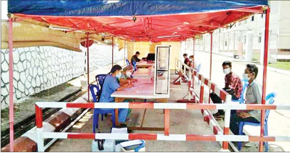
သီးသန့်စောင့်ကြည့်ရမည့်သူများအား စစ်ဆေးဆောင်ရွက်စဉ်။

နေပြည်တော် စက်တင်ဘာ ၁၇ ကိုဗစ်-၁၉ ရောဂါ အတည်ပြု လူနာများနှင့် သီးသန့်စောင့်ကြည့် ရမည့်သူများ ထားရှိရန်အတွက် တိုင်းစစ်ဌာနချုပ် နယ်မြေ အသီးသီးရှိ တပ်မတော်ဆေးရုံ များ၊ နယ်မြေခံသင်တန်းကျောင်း များ၊ စစ်ကြောရေးနှင့် တည်းခိုရေး စခန်းများ၌ ကြိုတင်ပြင်ဆင်မှု များကို လုပ်ဆောင်လျက်ရှိပြီး ပြီးစီးသည့်နေရာများတွင် စနစ် တကျ လက်ခံ၍ ကျန်းမာရေး စောင့်ရှောက်မှု လုပ်ငန်းများ ဆောင်ရွက်ပေးလျက်ရှိသည်။ ထို့ပြင် ကျန်းမာရေးဝန်ကြီး