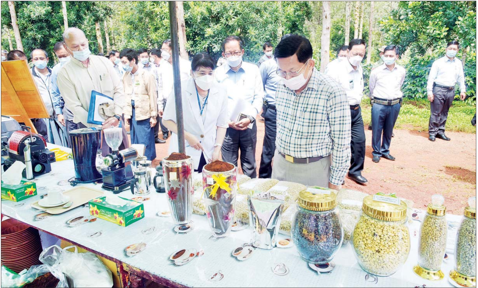
နိုင်ငံတော်စီမံအုပ်ချုပ်ရေးကောင်စီဥက္ကဋ္ဌ၊ နိုင်ငံတော်ဝန်ကြီးချုပ် ဗိုလ်ချုပ်မှူးကြီး မင်းအောင်လှိုင် ပြင်ဦးလွင်မြို့ Creation Myanmar Coffee Farm ကော်ဖီခြံအတွင်း ခင်းကျင်းပြသထားသည့် ကော်ဖီထုတ်ကုန်များ၊ မျိုးစေ့များ၊ လုပ်ငန်းသုံးပစ္စည်းကိရိယာများကို လေ့လာကြည့်ရှုစဉ်။

နေပြည်တော် စက်တင်ဘာ ၁၇ နိုင်ငံတော် စီမံအုပ်ချုပ်ရေးကောင်စီဥက္ကဋ္ဌ၊ နိုင်ငံတော်ဝန်ကြီးချုပ် ဗိုလ်ချုပ်မှူးကြီး မင်းအောင်လှိုင်သည် ယနေ့ နံနက်ပိုင်းတွင် နိုင်ငံတော်စီမံအုပ်ချုပ်ရေးကောင်စီ အဖွဲ့ဝင်များ၊ ပြည်ထောင်စုဝန်ကြီးများ၊ တပ်မတော် အရာရှိကြီးများနှင့် တာဝန်ရှိသူများနှင့်အတူ မန္တလေးတိုင်းဒေသကြီး၊ ပြင်ဦးလွင်မြို့အတွင်း၌ အားကစားကဏ္ဍ၊ စီးပွားရေးကဏ္ဍနှင့် ခရီးသွားလုပ်ငန်းဆိုင်ရာတို့တွင် မြှင့်တင်ဆောင်ရွက်ပေးနိုင်မည့် အခြေအနေများကို လိုက်လံကြည့်ရှုစစ်ဆေးသည်။ ဦးစွာ နိုင်ငံတော်စီမံအုပ်ချုပ်ရေးကောင်စီဥက္ကဋ္ဌ၊ နိုင်ငံတော်ဝန်ကြီးချုပ်နှင့် အဖွဲ့ဝင်များသည် ပြင်ဦးလွင်ခရိုင် အားကစားလေ့ကျင့်ရေးစခန်းသို့ ရောက်ရှိကြပြီး အားကစားကွင်းအဆင့်မြှင့်တင်ခြင်း လုပ်ငန်းစာမျက်နှာ ၃ ကော်လံ ၁ ။