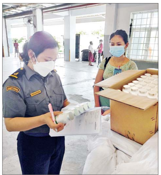
၂၀၂၁ ခုနှစ်၊ ဇူလိုင်လ ၁၄ ရက်နေ့ ရန်ကုန်အပြည်ပြည်ဆိုင်ရာလေဆိပ်တွင် ကုမ္ပဏီရုံစုံမှ Vitamin C+ Zinc + D3 Tablets ၂၀၄၀၊ Rosinox (Enoxparin Sodium) ၁၁၀၀၀၊ Enox-K40 Injection ၈၀၀၀၊ Softgels Of Vitamins Minerals ၁၁၄၀၀၊ Test Kit ၁၀၂၆၀၊ Centrifuge "Bbrc-101" နှစ်ခု၊ Blocheminal Analyzer လေးခု။

နေပြည်တော် စက်တင်ဘာ ၁၇ အကောက်ခွန်ဦးစီးဌာနအနေဖြင့် ကိုဗစ်-၁၉ ရောဂါ ကာကွယ်၊ ထိန်းချုပ်၊ ကုသရေး ဆေးနှင့်ပစ္စည်းများအား ရေကြောင်း၊ လေကြောင်း၊ ဆိပ်ကမ်း၊ နယ်စပ်ဂိတ်အသီးသီးမှ နေ့စဉ်လွယ်ကူ ချောမွေ့စွာ စစ်ဆေးထုတ်ပေး လျက်ရှိသည်။