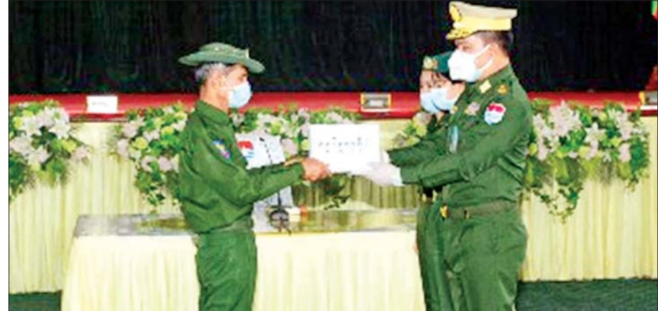
ကမ်းရိုးတန်းဒေသ တိုင်းစစ်ဌာနချုပ် တိုင်းမှူး ဗိုလ်ချုပ်စောသန်းလှိုင် ခြိတ်မြို့နယ်အတွင်းရှိ ပြည်သူ့စစ် (ဌာန)တပ်ဖွဲ့များကို ချီးမြှင့်ငွေများ ထောက်ပံ့စဉ်။

ဦးစွာ တိုင်းမှူးက အဖွင့်အမှာစကားပြောကြား သည်။ ထို့နောက် တက်ရောက်လာကြသူများက မွန်ပြည်နယ်နှင့် ကရင်ပြည်နယ်အတွင်း ကိုဗစ်-၁၉ ရောဂါ ကာကွယ်၊ ထိန်းချုပ်၊ ကုသရေးနှင့် သဘာဝ ဘေးအန္တရာယ်ကြိုတင် ကာကွယ်ရေးဆိုင်ရာများနှင့် ပတ်သက်၍ ဆွေးနွေးတင်ပြကြရာ တိုင်းမှူးက လိုအပ်သည်များ ပေါင်းစပ်ညှိနှိုင်းဆောင်ရွက်ပေးခဲ့ ကြောင်း သတင်းရရှိသည်။ သတင်းစဉ်