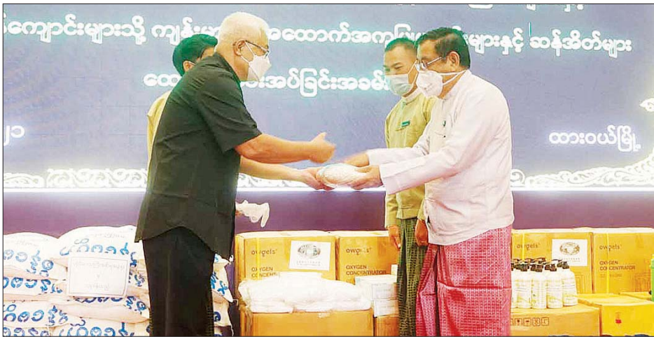
မြိတ်- ထားဝယ်ခရိုင်(KNU) ကရင်အမျိုးသား ဆန်အိတ်များ လက်ခံရရှိသူများကိုယ်စား မြိတ်- အစည်းအရုံးသို့ (ငွေကျပ် ၂၉၃၂၄၀၀၀တန်ဖိုးရှိ) ထားဝယ်ခရိုင် (KNU)ကရင်အမျိုးသား အစည်းအရုံးမှ ပဋိပညာပေးအပ်ရာ တာဝန်ရှိသူများကလက်ခံရယူပြီး ပြောကြားကြောင်း သိရသည်။ ကျန်းမာရေး အထောက်အကူပြုပစ္စည်းနှင့် တိုင်းဒေသကြီး(ပြန်/ဆက်)

တိုင်းဒေသကြီးအစိုးရအဖွဲ့အနေဖြင့် တိုင်းရင်းသားများကို လိုအပ်သော ဆေးဝါးများနှင့် ကျန်းမာရေး အထောက်အကူပြုပစ္စည်းများ ထောက်ပံ့ပေးအပ်ခြင်းဖြစ်ပြီး လိုအပ်ချက်များရှိပါက တင်ပြပေးရန် လိုအပ်ကြောင်း၊ တိုင်းရင်းသားများအား မှတ်ပုံတင် ပြုလုပ်ပေးခြင်းလုပ်ငန်းနှင့် ကိုဗစ်-၁၉ ရောဂါ ကာကွယ်ဆေးထိုးခြင်းလုပ်ငန်းများကို စီစဉ် ဆောင်ရွက်ပေးသွားမည်ဖြစ်ကြောင်း ပြောကြားသည်။ ထို့နောက် ကိုဗစ်-၁၉ ရောဂါ ကာကွယ် ထိန်းချုပ် နိုင်ရေးအတွက် တိုင်းဒေသကြီးအစိုးရအဖွဲ့က မြိတ်ခရိုင် မြိတ်မြို့နယ်၊ ကျွန်းစုမြို့နယ်နှင့် တနင်္သာရီ မြို့နယ်အတွင်းရှိ ကရင်တိုင်းရင်းသားလူမျိုးများအား (ငွေကျပ် ၅၁၄၇၅၀၀ တန်ဖိုးရှိ) ကျန်းမာရေး အထောက်အကူပြုပစ္စည်းနှင့် ဆန်အိတ်ပစ္စည်းများကိုလည်းကောင်း၊ ကျွန်းစုမြို့နယ်အတွင်းရှိ မော်ကယ်(ဆလုံ)တိုင်းရင်းသားများအား (ငွေကျပ် ၄၂၄၀၀၀၀ တန်ဖိုးရှိ) ပစ္စည်းများကိုလည်းကောင်း၊