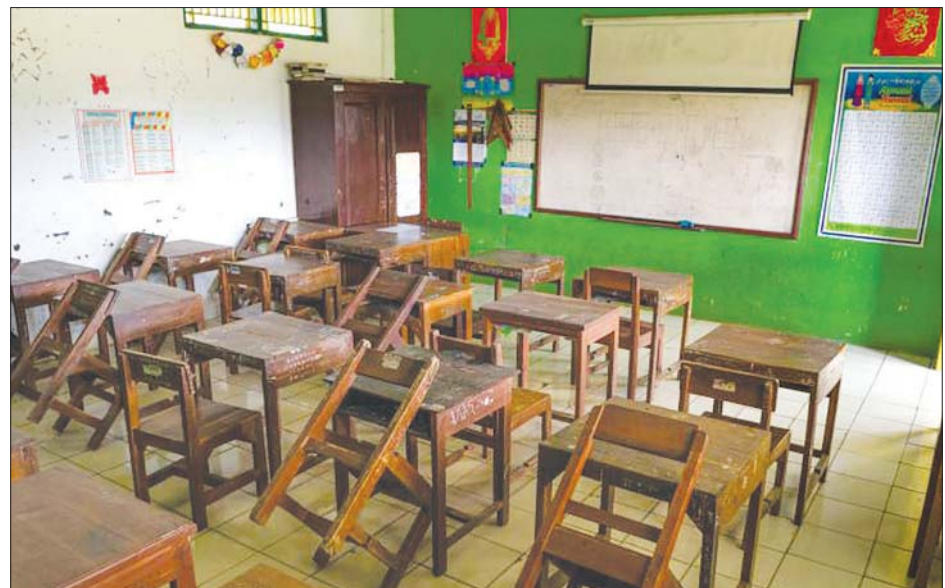
ပိတ်ထားရသည့် စာသင်ခန်းတစ်ခုကို တွေ့ရစဉ်။

လုံးပိတ်ထားခြင်း သို့မဟုတ် တစ်စိတ်တစ်ပိုင်းပိတ် ထားခြင်းမျိုးနှင့် ကြုံတွေ့နေရသည်။ ကမ္ဘာအနှံ့ စာသင်ကျောင်းများမှာ ပြန်လည်ဖွင့် လှစ်ပြန်သောကြောင့် ကျောင်းသားများသည် တတိယစာသင်နှစ်ကို စာသင်ခန်းအတွင်း ခြေမချ လိုက်ရဘဲ တက်ရောက်နေကြပြန်သည်ဟု ယူနီ ဆက်ဖ်မှ အမှုဆောင်ဒါရိုက်တာ ဟန်နီတာဖိုးဒ်က ပြောသည်။