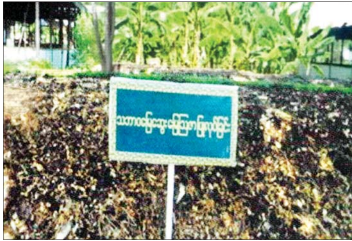
သဘာဝမြေဆွေးမြေဩဇာပြုလုပ်ခြင်း။

ကျွန်တော်က “ဟလို” တစ်ချက်သာထူးလိုက်ရ သော်လည်း အစ်ကိုကြီး၏ စကားက တရစပ် ပြောလာခြင်းဖြစ်သည်။ အစ်ကိုကြီးကား အသက် ရှစ်ဆယ်ပြည့်နေပြီ။ လယ်မလုပ်တော့ပါ။ အမေ့ရွာ ဖျာပုံမြို့နယ် သလိပ်ကြီးကျေးရွာတွင် နေထိုင်ခြင်း ဖြစ်သည်။ တစ်ဝမ်းကွဲအစ်ကို ဖြစ်သော်လည်း လေးတန်းအောင်ပြီးကတည်းက ကျွန်တော်တို့အိမ် တွင် အလယ်တန်းနှင့် အထက်တန်းပညာ ဆက်လက်သင်ယူခဲ့သည်။ သို့ဖြစ်၍ တစ်ဝမ်းကွဲ ညီအစ်ကိုဖြစ်သော်လည်း ညီအစ်ကိုအရင်းလိုပင် ချစ်ခင်ပါသည်။ (၁၀) တန်းအထိ ကျောင်းတက် ခဲ့သော်လည်း (၁၀) တန်း မအောင်ပါ။ အစ်ကိုကြီးတို့ မိသားစုတွင် အစ်ကိုကြီးက သားအကြီးဆုံးဖြစ်၍ (၁၀) တန်းစာမေးပွဲဖြေပြီးကတည်းက ရွာသို့ပြန်၍ သူ့မိဘနှင့်အတူ လယ်စိုက်သည်။ အားသည့်အချိန် စာဖတ်သည်။ အိမ်ထောင်မပြုခဲ့၍ ယခုထိ လူပျိုကြီး ဖြစ်နေပါသည်။