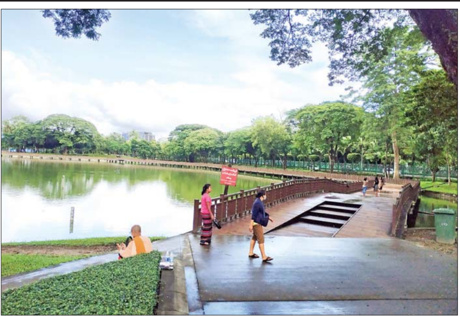
ရန်ကုန်မြို့ရှိ ပန်းခြံများ ပုံမှန်အတိုင်း ပြန်လည်ဖွင့်လှစ်ခဲ့ရာ စက်တင်ဘာ ၁၇ ရက်က ကန်တော်ကြီး ပန်းခြံတွင် ပြည်သူများ စိတ်အေးချမ်းသာစွာ လာရောက်အပန်းဖြေလျက်ရှိသည်ကို တွေ့ရစဉ်။