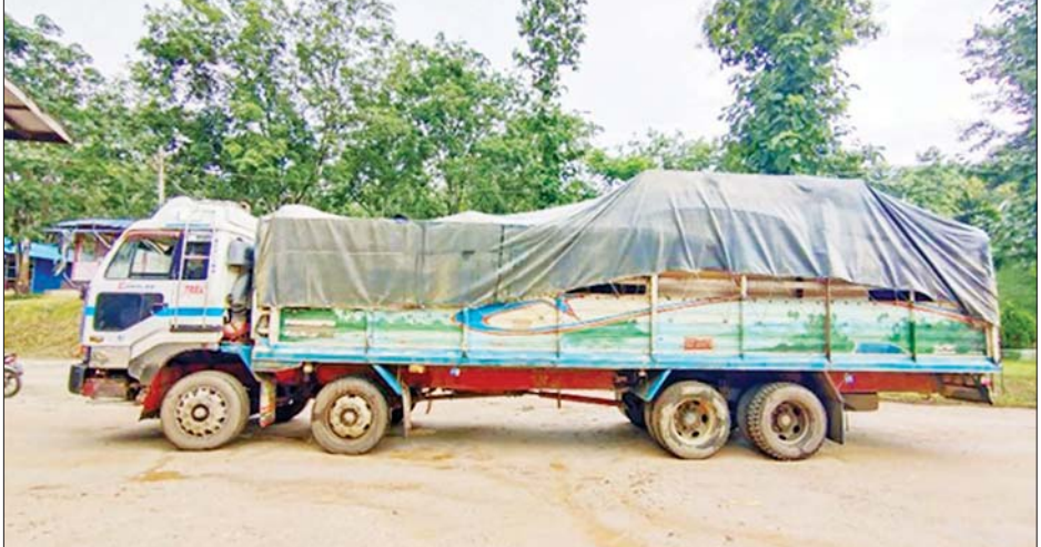
ချင်းရွှေဟော်နယ်စပ်ကုန်သွယ်ရေးစခန်းမှ ကိုဗစ်-၁၉ ရောဂါ ကာကွယ်၊ ထိန်းချုပ်၊ ကုသရေးဆိုင်ရာ ပစ္စည်းများ တင်သွင်းလာစဉ်။

နေပြည်တော် စက်တင်ဘာ ၁၇ စီးပွားရေးနှင့် ကူးသန်းရောင်းဝယ် ရေးဝန်ကြီးဌာနအနေဖြင့် ကိုဗစ်- ၁၉ ရောဂါ ကာကွယ်၊ ထိန်းချုပ်၊ ကုသရေးဆိုင်ရာ ပစ္စည်းများကို လေကြောင်း၊ ရေကြောင်းနှင့် နယ်စပ်ကုန်သွယ်ရေးစခန်းများမှ အဆင်ပြေချောမွေ့စွာ တင်သွင်း နိုင်ရေးအတွက် အချိန်နှင့် တစ်ပြေးညီ စီစဉ်ဆောင်ရွက်ပေး လျက်ရှိရာ ယနေ့တွင် ရန်ကုန် အပြည်ပြည်ဆိုင်ရာ လေဆိပ်၊ ဆိပ်ကမ်းများနှင့် မြဝတီ၊ ချင်းရွှေဟော်နယ်စပ်စခန်း နှစ်ခု တို့မှ တင်သွင်းရာ၌ ကုမ္ပဏီလေးခု မှ ယာဉ်စီးရေ ငါးစီးဖြင့် အောက်