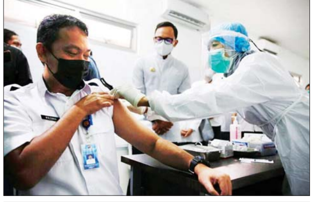
အင်ဒိုနီးရှားနိုင်ငံတွင် ကိုဗစ်-၁၉ ကာကွယ်ဆေးထိုးပေးနေသည်ကို တွေ့ရစဉ်။

ထိုးပေးနိုင်ရန် ရည်မှန်းချက်ထား ဆောင်ရွက်လျက်ရှိသည်။ ဆင်ဟွာ