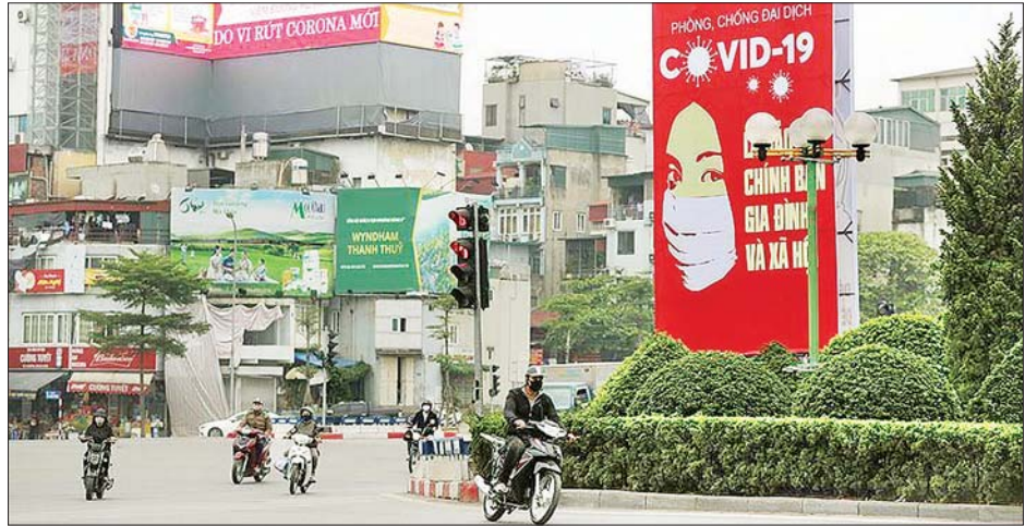
ဗီယက်နမ်နိုင်ငံ မြို့တော်ဟနွိုင်းတွင် ကိုဗစ်-၁၉ သတိပေးဆိုင်ဘုတ်စိုက်ထူထားသည်ကိုတွေ့ရစဉ်။

စက်တင်ဘာ ၁၇ ရက်အထိ ဗီယက်နမ်နိုင်ငံတွင် ပြည်တွင်း ကိုဗစ်-၁၉ ကူးစက် ဖြစ် ပွား သူပေါင်း ၆၆၃၂၂ ဦးရှိကြောင်း ကျန်းမာရေး ဝန်ကြီးဌာနက သတင်းထုတ်ပြန်သည်။ ဆင်ဟွာ