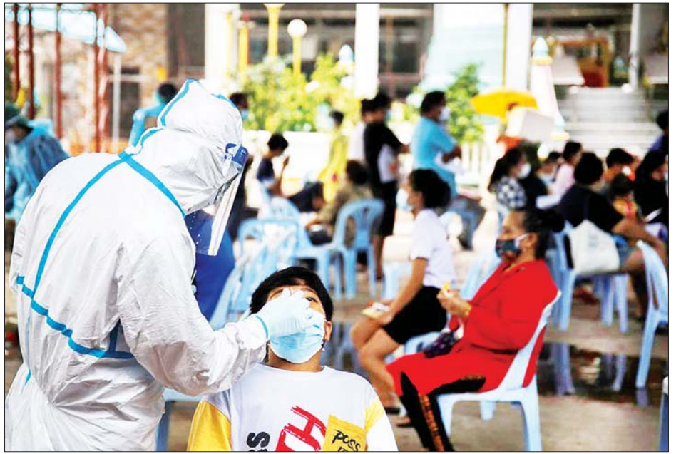
ထိုင်းနိုင်ငံ ဘန်ကောက်မြို့၌ ကိုဗစ်-၁၉ စမ်းသပ်စစ်ဆေးရန် ကျန်းမာရေးဝန်ထမ်းတစ်ဦးက နှာခေါင်း တို့ဖတ် နမူနာရယူနေစဉ်။

ယခုနှစ်ကုန်တွင် လူဦးရေ၏ ၇၀ ရာခိုင်နှုန်းကို ကိုဗစ်-၁၉ ကာကွယ်ဆေး လွှမ်းခြုံထိုးပေးနိုင် ရန် ရည်ရွယ်ထားကြောင်း သိရ သည်။ ဆင်ဟွာ