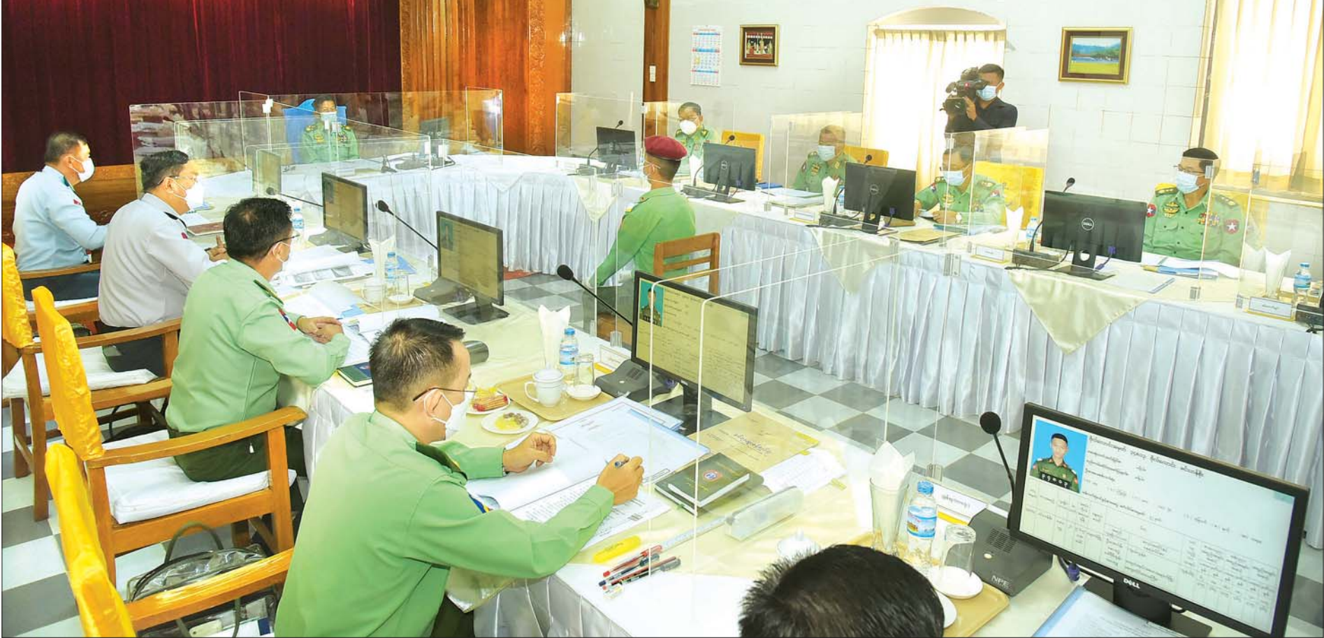
နိုင်ငံတော်စီမံအုပ်ချုပ်ရေးကောင်စီဥက္ကဋ္ဌ၊ တပ်မတော်ကာကွယ်ရေးဦးစီးချုပ် ဗိုလ်ချုပ်မှူးကြီး မင်းအောင်လှိုင် ပြင်ဦးလွင်မြို့၊ စစ်တက္ကသိုလ်၌ ပြုလုပ်သည့် စစ်တက္ကသိုလ် ဗိုလ်လောင်းသင်တန်းအမှတ်စဉ်(၆၄) စစ်လက်ရုံး ရွေးချယ်ပွဲသို့ တက်ရောက်စိစစ်ရွေးချယ်စဉ်။