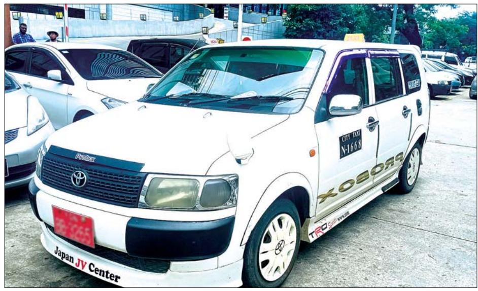
စီးတီးတက္ကစီ မှတ်ပုံတင်ထားသည့် အငှားယာဉ်တစ်စီးကို တွေ့ရစဉ်။