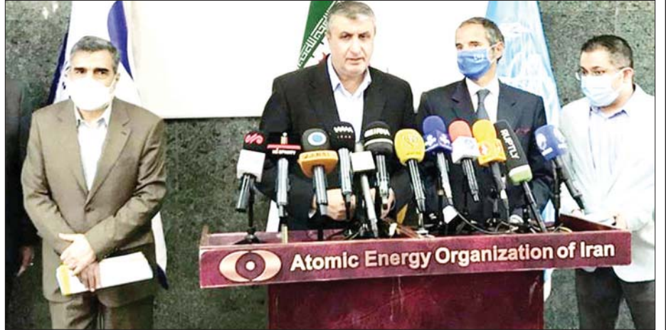
အီရန်နိုင်ငံ၏ အကျွမ်းစွမ်းအင်အဖွဲ့အစည်းမှ အကြီးအကဲဖြစ်သူ မိုဟာမက် အက်စ်လာမီ မိန့်ခွန်း ပြောနေစဉ်။