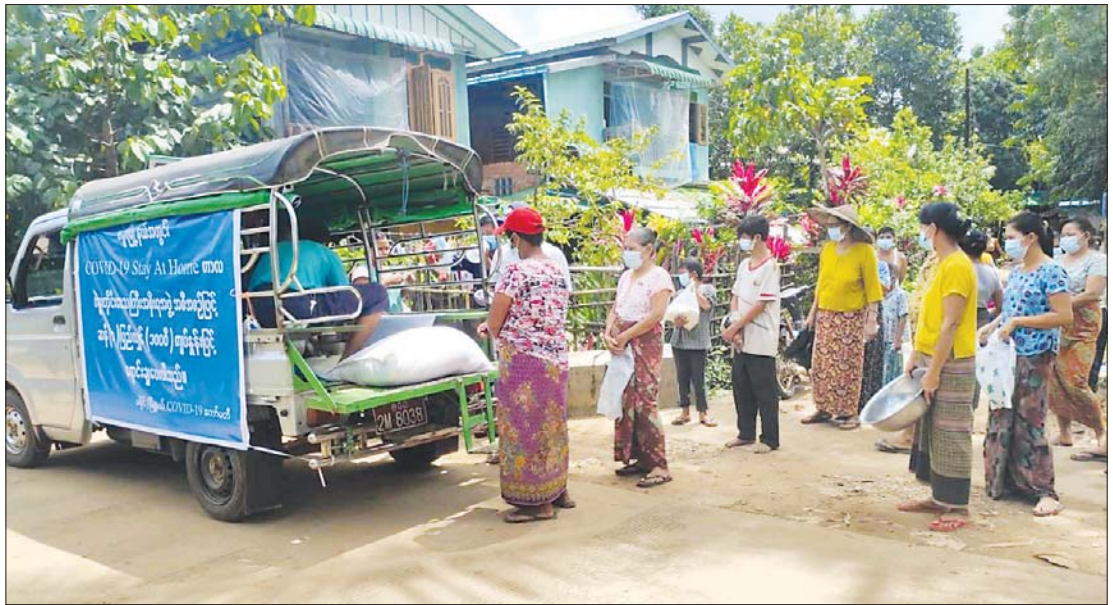
ပြည်သူများအား ဈေးကားများဖြင့် အခြေခံစားသောက်ကုန်များအား ဈေးနှုန်းချိုသာစွာဖြင့် လိုက်လံရောင်းချပေးနေမှုကို တွေ့ရစဉ်။

ယခုလအတွင်းမှာ အခြေခံစားကုန်နဲ့ အိမ်သုံးဆေးဝါးတွေကို ရွှေ့လျားချေး ကားစနစ်နဲ့ ဈေးနှုန်းချိုသာစွာ လှည့်လည်ရောင်းချပေးနိုင်ခဲ့တဲ့အတွက် ကိုဗစ်ကြောင့် ဆေးလိုအပ်ချက်နဲ့ စားနပ် ရိက္ခာလိုအပ်ချက်ကို ဖြည့်ဆည်းပေးနိုင် ခဲ့တာကြောင့် ပြည်သူများအတွက် အဆင်ပြေလွယ်ကူခဲ့ပါတယ်။