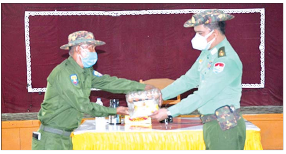
ထိုသို့ ပေးအပ်လျက်ရှိရာ ယနေ့တွင် တနင်္သာရီတိုင်းဒေသကြီး ထားဝယ်ခရိုင် လောင်းလုံးမြို့နယ်အတွင်းရှိ မြန်မာနိုင်ငံရဲတပ်ဖွဲ့ဝင်များနှင့် မိသားစုဝင်များ၊ ပြည်သူ့စစ်(ဌာနေ)တပ်ဖွဲ့ဝင်များနှင့် လုံခြုံရေးတပ်ဖွဲ့ဝင်များအတွက် စားသောက်ဖွယ်ရာများနှင့် ထောက်ပံ့ငွေများကို သိရသည်။ သတင်းစဉ်

နေပြည်တော် စက်တင်ဘာ ၁၃ ကိုဗစ်-၁၉ ရောဂါ ကာကွယ်၊ ထိန်းချုပ်၊ ကုသရေးလုပ်ငန်းများကို အရှိန်အဟုန်ဖြင့် ဆောင်ရွက်လျက်ရှိရာ သွားလာမှုကန့်သတ်ချက်များကြောင့် စစ်မှုထမ်းဟောင်းအဖွဲ့ဝင်များ၊ မြန်မာနိုင်ငံရဲတပ်ဖွဲ့ဝင်များ၊ ပြည်သူ့စစ်(ဌာနေ)အဖွဲ့ဝင်များ၊ ကျန်းမာရေးဝန်ထမ်းများ၊ စေတနာ့ဝန်ထမ်းများနှင့် ဒေသခံပြည်သူများ စားရေးအစာပြေစေရေးအတွက် တပ်မတော်နှင့် စေတနာ့ရင်အလှူရှင်များက စားသောက်ဖွယ်ရာများနှင့် ရောဂါကာကွယ်ရေး အထောက်အကူပြုပစ္စည်းများကို ထောက်ပံ့ လှူဒါန်းလျက်ရှိသည်။