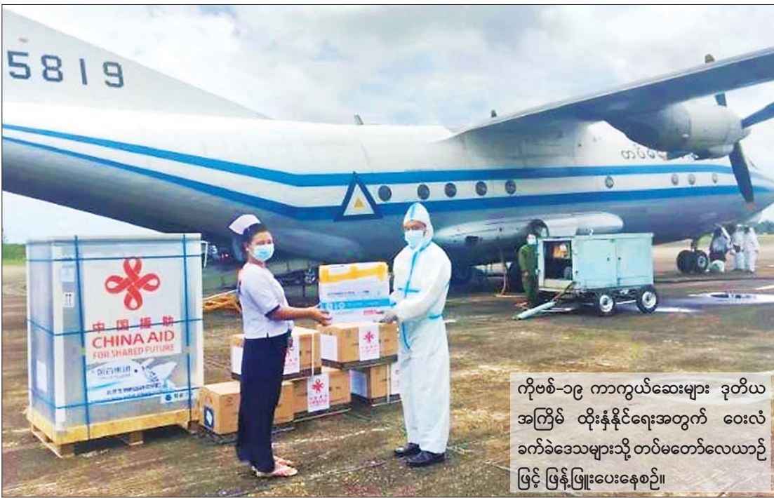
ကိုဗစ်-၁၉ ကာကွယ်ဆေးများ ဒုတိယ အကြိမ် ထိုးနှံနိုင်ရေးအတွက် ဝေးလံ ခက်ခဲဒေသများသို့ တပ်မတော်လေယာဉ် ဖြင့် ဖြန့်ဖြူးပေးနေစဉ်။

ပြည်တွင်းပုဂ္ဂလိကစက်ရုံ၊ အလုပ်ရုံ တွေကို မရပ်နားဘဲ အလုပ်ရှင်၊ အလုပ် သမားတွေ ထိခိုက်နစ်နာမှုမရှိစေဖို့ ကိုဗစ်စည်းကမ်းချက်တွေနဲ့အညီ စနစ် တကျစစ်ဆေးပြီးမှ ဖွင့်လှစ်ခွင့်ပေးခဲ့ သလို အလုပ်သမားထုကြီးရဲ့ အခက်အခဲ တွေကိုဖြေရှင်းဖို့အတွက် အစိုးရ၊ အလုပ် ရှင်၊ အလုပ်သမားသုံးပွင့်ဆိုင် ညှိနှိုင်း ဆွေးနွေးပွဲကိုလည်း ဩဂုတ်လ ၃ ရက်က ကျင်းပခဲ့ပြီး အလုပ်သမားတွေရဲ့ အခွင့် အရေးနဲ့အခက်အခဲတွေကို ညှိနှိုင်းပေး ခဲ့ပါတယ်။ ထို့အတူ လူမှုဖူလုံရေးအဖွဲ့ကို ထည့်ဝင်ကြေးတွေ ပေးသွင်းရာမှာလည်း အလုပ်ရှင်၊ အလုပ်သမား အခက်အခဲ များကို ဖြေလျှော့ပေးတဲ့အစီအစဉ်အဖြစ် ခြောက်လ နောက်ဆုတ်ပေးသွင်းခွင့်နဲ့ အဲဒီကာလတွေမှာ ပျက်ကွက်ကြေးကို လည်း ကင်းလွတ်ခွင့်ကို ဩဂုတ်လ ၆ ရက်က ထုတ်ပြန်ကြေညာခဲ့ပါတယ်။ အာမခံအလုပ်သမားတွေအတွက် လူမှု ဖူလုံရေး-ကဲဝဲလ် အထွေထွေရောဂါက