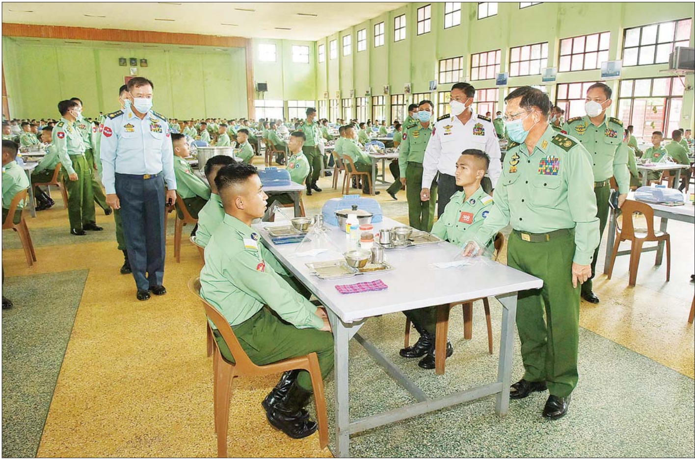
နိုင်ငံတော်စီမံအုပ်ချုပ်ရေးကောင်စီဥက္ကဋ္ဌ၊ တပ်မတော်ကာကွယ်ရေးဦးစီးချုပ် ဗိုလ်ချုပ်မှူးကြီး မင်းအောင်လှိုင်နှင့် အဖွဲ့ဝင်များ ပြင်ဦးလွင်မြို့၊ စစ်တက္ကသိုလ် ဘုရင့်နောင်တပ်ရင်း ဗိုလ်လောင်း စားရိပ်သာ၌ သင်တန်းသားဗိုလ်လောင်းများအား ရင်းရင်းနှီးနှီး လိုက်လံနှုတ်ဆက်၍ အားပေးစကား ပြောကြားစဉ်။

ထို့နောက် နိုင်ငံတော်စီမံအုပ်ချုပ်ရေး ကောင်စီ ဥက္ကဋ္ဌ၊ တပ်မတော် ကာကွယ်ရေးဦးစီးချုပ်နှင့် အဖွဲ့ဝင်များသည် ဘုရင့်နောင်တပ်ရင်း ဗိုလ်လောင်း စားရိပ်သာ၌ သင်တန်းသားဗိုလ်လောင်းများနှင့် အတူ နေ့လယ်စာ အတူတကွ သုံးဆောင်ကြပြီး ဗိုလ်လောင်းများအား ရင်းရင်းနှီးနှီး လိုက်လံ နှုတ်ဆက်၍ အားပေးစကား ပြောကြားခဲ့သည်။ ယင်းနောက် မွန်းလွဲပိုင်းတွင် စစ်လက်ရုံး ရွေးချယ်မှု အား ဆက်လက်ပြုလုပ်ခဲ့ကြောင်း သတင်းရရှိသည်။ သတင်းစဉ်