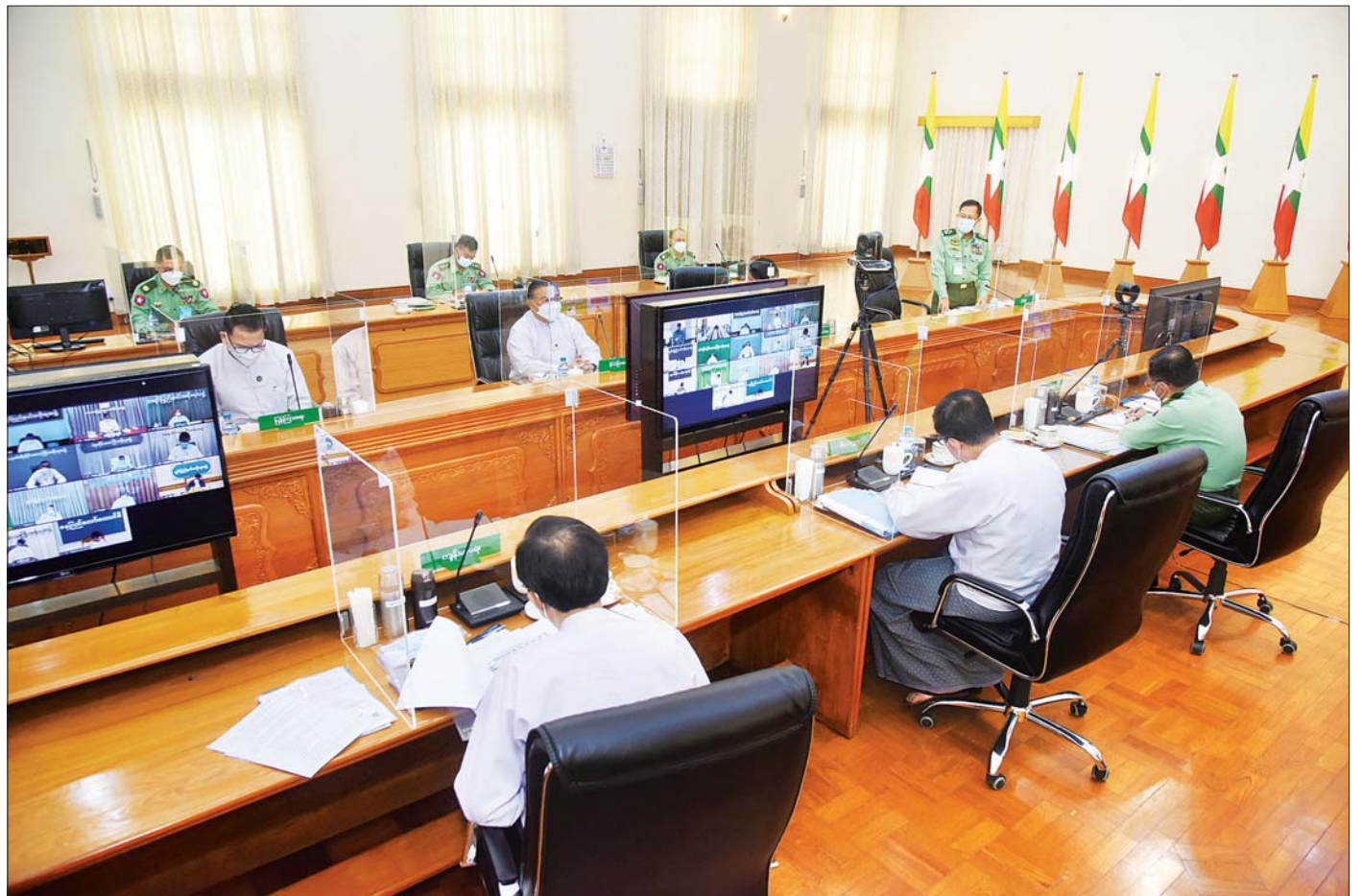
နိုင်ငံတော်စီမံအုပ်ချုပ်ရေးကောင်စီ ဒုတိယဥက္ကဋ္ဌ၊ ပြည်ထောင်စုသမ္မတမြန်မာနိုင်ငံတော်အစိုးရအဖွဲ့၊ ဒုတိယဝန်ကြီးချုပ် ဒုတိယဗိုလ်ချုပ်မှူးကြီး စိုးဝင်း ကိုဗစ် - ၁၉ ရောဂါ ကာကွယ်၊ ထိန်းချုပ်၊ ကုသရေးဆိုင်ရာ (၁၂) ကြိမ်မြောက် ညှိနှိုင်းအစည်းအဝေးတွင် အမှာစကားပြောကြားစဉ်။

ဦးစွာ နိုင်ငံတော်စီမံအုပ်ချုပ်ရေးကောင်စီ ဒုတိယဥက္ကဋ္ဌ၊ ဒုတိယဝန်ကြီးချုပ် ဒုတိယဗိုလ်ချုပ် မှူးကြီးစိုးဝင်းက အဖွဲ့အမှာစကားပြောကြားရာတွင် ယနေ့ အစည်းအဝေးအား နိုင်ငံတော်ဝန်ကြီးချုပ် ကိုယ်စား ကျင်းပပြုလုပ်ခြင်းဖြစ်ကြောင်း၊ မိမိတို့ နိုင်ငံတွင် ကိုဗစ်-၁၉ ရောဂါတွေ့ရှိမှုရက်အနေဖြင့် စက်တင်ဘာ ၁၂ ရက်အထိ ၅၃၈ ရက်ရှိကာ ဓာတ်ခွဲ အတည်ပြုလူနာစုစုပေါင်း ၄၃၈၃၃ ဦးရှိသည်ကို တွေ့ရှိရကြောင်း၊ ကိုဗစ်-၁၉ ရောဂါ တွေ့ရှိမှုများကို