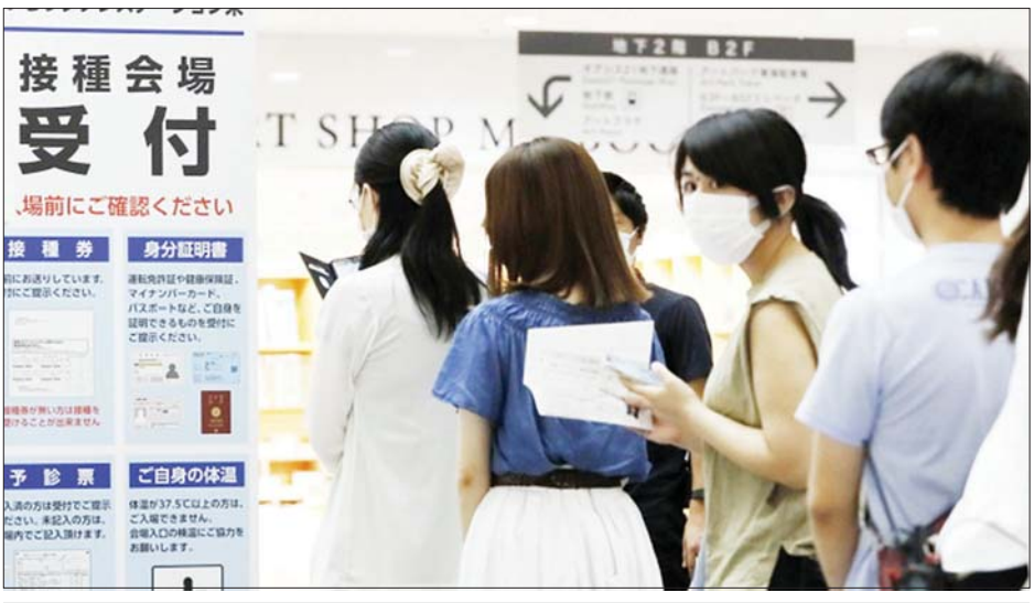
အိုက်ချီခရိုင်တွင် ကာကွယ်ဆေးထိုးရန် စောင့်ဆိုင်းနေကြသူများကို တွေ့ရစဉ်။