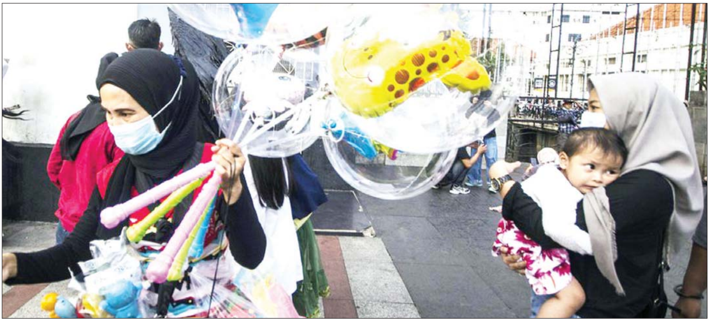
အင်ဒိုနီးရှားနိုင်ငံ အနောက်ဂျာဗား ဘန်ဒန်းရှိ လမ်းတစ်ခုပေါ်တွင် ဘောလုံးများသယ်ဆောင်ထားသည့် ဈေးသည်တစ်ဦးကို တွေ့ရစဉ်။

ခရီးသွားလာရေးနဲ့ စီးပွားရေးဖန်တီးမှုဆိုင်ရာ ဝန်ကြီး ဆန်ဒီယာဂါ ယူနိုက်က ရပ်ဆိုင်းထားတဲ့ ခရီး သွားလာမှုတွေ ပြန်လည်နိုးထလာမှုနဲ့ အတူလာ မယ့် ခရီးသွားကြွေးမြန်ဆပ်မယ့်ရာသီမှာ ခရီးသွား လာရေးကဏ္ဍကို အဆင်သင့်ပြင်ဆင်ထားဖို့လိုတယ်