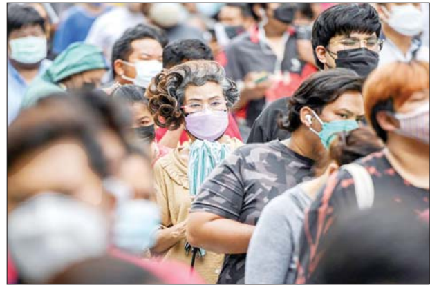
ဘန်ကောက်မြို့တွင် ကိုဗစ်-၁၉ ကာကွယ်ဆေးထိုးနှံရန် စောင့်ဆိုင်းနေကြစဉ်။