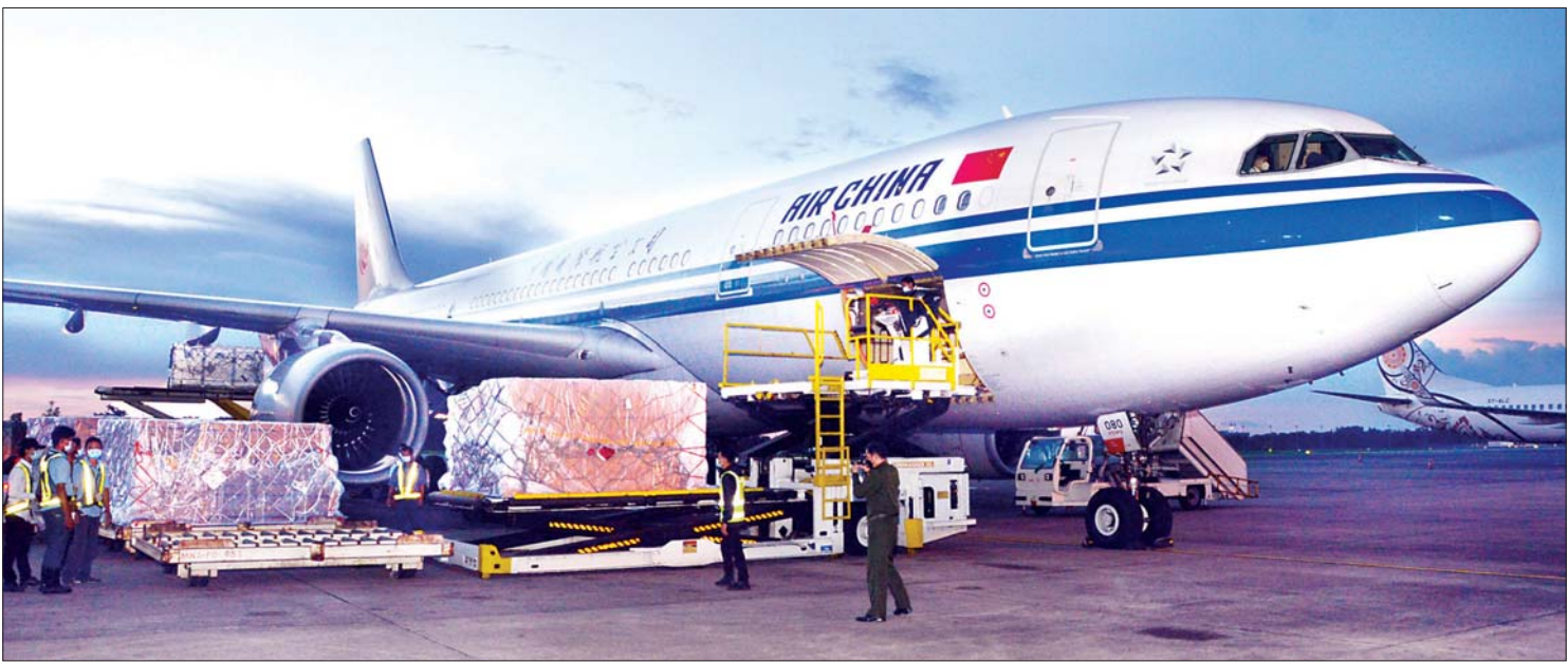
တရုတ်ပြည်သူ့လွတ်မြောက်ရေးတပ်မတော်နှင့် ပေကျင်းမြို့ရှိ မြန်မာသံရုံး၊ စစ်သံရုံးတို့က လှူဒါန်းသည့် ကိုဗစ်-၁၉ ရောဂါ ကာကွယ်ဆေးများနှင့် ဆေးဘက်ဆိုင်ရာ အထောက်အကူပစ္စည်းများ ဩဂုတ် ၂၂ ရက်က ရန်ကုန်အပြည်ပြည်ဆိုင်ရာလေဆိပ်သို့ ရောက်ရှိလာစဉ်။

မှာရှိတဲ့ ပြည်သူ့ဆေးရုံ၊ တပ်မတော်ဆေးရုံ၊ ကျန်းမာရေးဌာနတွေ၊ ကျန်းမာရေးဝန်ထမ်းတွေနဲ့ ကိုဗစ်စင်တာတွေ၊ ပရဟိတအသင်းအဖွဲ့တွေထံကို အောက်ဆီဂျင်အိုးအပါအဝင် ရောဂါကာကွယ်ရေးအထောက်အကူပြု ပစ္စည်းတွေကို ဖြန့်ဝေလှူဒါန်းခြင်းတွေကို ယခုလအတွင်း အများဆုံးမြင်တွေ့ခဲ့ရပါတယ်။ ကိုဗစ်အတည်ပြုလူနာများနဲ့ သီးသန့် စောင့်ကြည့်ရမယ့်သူများအတွက် နေရာထိုင်ခင်း ကြိုတင်ပြင်ဆင်မှုတွေကိုလည်း တိုင်းစစ်ဌာနချုပ်နယ်မြေအသီးသီးမှာရှိတဲ့ တပ်မတော်ဆေးရုံတွေ၊ နယ်မြေခံသင်တန်းကျောင်းတွေ၊ စစ်ကြောရေးနဲ့တည်းခိုရေးစခန်းတွေမှာ စဉ်ဆက်မပြတ် ကြိုတင်ပြင်ဆင်တာ၊ လက်ခံထားရှိတာတွေကို လုပ်ဆောင်ခဲ့ပါတယ်။