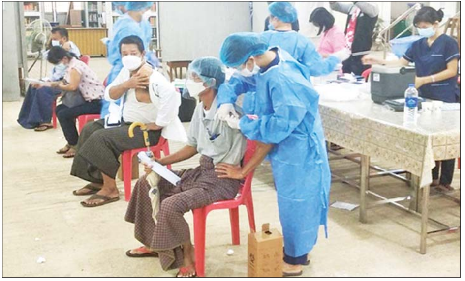
ဆေးရုံများမှ ဆရာဝန်များ၊ သက်ဆိုင်ရာ ကျန်းမာရေး ဝန်ထမ်းများ၊ စေတနာ့ဝန်ထမ်းများနှင့် ပူးပေါင်း၍ ကိုဗစ်-၁၉ ရောဂါ ကာကွယ်ဆေး ထိုးနှံပေးခြင်းများ ဆောင်ရွက်ပေးသည်။ ယင်းသို့ ဆောင်ရွက်ပေးနေမှုများကို သက်ဆိုင်ရာ တိုင်းစစ်ဌာနချုပ်များမှ တာဝန်ရှိသူများက သွားရောက် ကြည့်ရှုအားပေးပြီး လိုအပ်သည်များ ညှိနှိုင်း ဆောင်ရွက်ပေးခဲ့ကြောင်း သိရသည်။ သတင်းစဉ်

ဘိုးဘွားများ၊ စေတနာ့ဝန်ထမ်းများ၊ ဌာနဆိုင်ရာ ဝန်ထမ်းများနှင့် ပြည်သူစုစုပေါင်း ၃၃၉၇ ဦး၊ ရခိုင် ပြည်နယ်နှင့် ချင်းပြည်နယ်အတွင်းရှိ မြို့နယ် လေးမြို့နယ်မှ သံဃာတော်များ၊ စေတနာ့ဝန်ထမ်း များ၊ ဌာနဆိုင်ရာဝန်ထမ်းများ၊ တိုက်ပွဲရှောင်ပြည်သူ များနှင့် ဒေသခံပြည်သူ စုစုပေါင်း ၁၅၀၃ ဦး၊ စစ်ကိုင်းတိုင်းဒေသကြီး ကလေးမြို့နယ်နှင့် နဂါး ကိုယ်ပိုင်အုပ်ချုပ်ခွင့်ရဒေသ လေရီးမြို့တို့ရှိ သံဃာ တော်များ၊ သာသနာ့နယ်ဝင် သီလရှင်များ၊ ၆၅ နှစ်နှင့် အထက် သက်ကြီးဘိုးဘွားများ၊ ဌာနဆိုင်ရာဝန်ထမ်း များနှင့် ပြည်သူစုစုပေါင်း ၈၆၃ ဦး၊ မန္တလေးတိုင်း ဒေသကြီးအတွင်းရှိ ခရိုင်ခန့်ခွဲရသည့် သံဃာတော်များ၊ ၆၅ နှစ်နှင့်အထက် သက်ကြီးဘိုးဘွားများ၊ ဌာန ဆိုင်ရာ ဝန်ထမ်းများနှင့် ပြည်သူစုစုပေါင်း ၁၀၅၂၇ ဦး၊ ပဲခူးတိုင်းဒေသကြီးအတွင်းရှိ မြို့နယ် ၄ မြို့နယ်မှ သံဃာတော်များ၊ သာသနာ့နယ်ဝင်သီလရှင်များ၊ ၆၅ နှစ်နှင့်အထက် သက်ကြီးဘိုးဘွားများ၊ ဌာန ဆိုင်ရာဝန်ထမ်းများနှင့် ပြည်သူစုစုပေါင်း ၂၀၈၀ တို့အား တပ်မတော်မှ ဆေးအဖွဲ့များက ပြည်သူ့