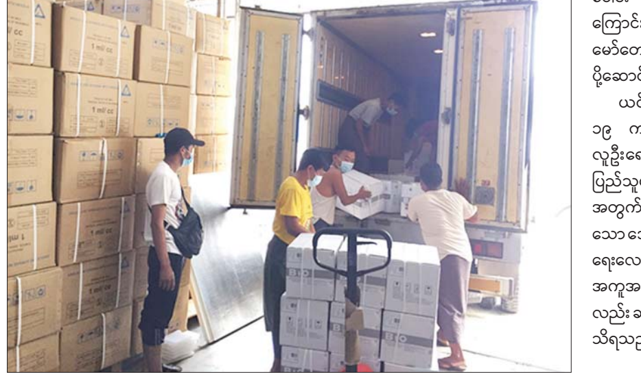
ယင်းသို့ ပေးပို့ဖြန့်ဖြူးပေးသော ကိုဗစ်-၁၉ ကာကွယ်ဆေးများကို ဦးတည်အုပ်စု လူဦးရေ ဦးစားပေးအစီအစဉ်များနှင့်အညီ ပြည်သူများသို့ အမြန်ဆုံး ထိုးနှံပေးနိုင်ရေး အတွက် ဆောင်ရွက်ခြင်းဖြစ်ပြီး ဝေးလံခက်ခဲ သော ဒေသများသို့ တပ်မတော်(လေ) ပို့ဆောင် ရေးလေယာဉ်များနှင့် မြန်မာ့လေကြောင်းတို့၏ အကူအညီများရယူကာ လေကြောင်းခရီးဖြင့် လည်း ဆက်လက်ဖြန့်ဖြူးပေးလျက် ရှိကြောင်း သိရသည်။ သတင်းစဉ်

ထိုသို့ဖြန့်ဖြူးပေးလျက်ရှိရာ ယနေ့တွင် ရန်ကုန်တိုင်းဒေသကြီးအတွင်း ဆေးအလုံး ပေါင်း ၃၀၀၀၀၀၊ ဧရာဝတီတိုင်းဒေသကြီး ပုသိမ်မြို့သို့ ဆေးအလုံးပေါင်း ၂၃၀၀၀၀၊ မွန်ပြည်နယ် မော်လမြိုင်မြို့သို့ ဆေးအလုံး ပေါင်း ၁၀၀၀၀၀၊ ကရင်ပြည်နယ် ဘားအံမြို့သို့ ဆေးအလုံးပေါင်း ၅၀၀၀၀၊ မကွေးတိုင်း ဒေသကြီးသို့ ဆေးအလုံးပေါင်း ၁၅၀၀၀၀ နှင့် ပဲခူးတိုင်းဒေသကြီး ပြည်မြို့သို့ ဆေးအလုံး ပေါင်း ၈၀၀၀၀ တို့ကို မြေပြင်ခရီးလမ်း ကြောင်းမှ Cold Chain Delivery Logistics မော်တော်ယာဉ်ကြီးများဖြင့် ဆက်လက် ပို့ဆောင်ပေးသည်။