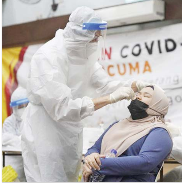
မလေးရှားနိုင်ငံတွင် ကိုဗစ်-၁၉ စစ်ဆေးရန် နှာခေါင်းတို့ဖတ်နမူနာ ရယူနေစဉ်။

ကိုဗစ်-၁၉ ကူးစက်ဖြစ်ပွား လျက်ရှိသူ ၂၃၇၇၇ ဦးအနက် ၁၃၃၈ ဦးမှာ အထူးကြပ်မတ်ကုသ ဆောင်တွင် ဆေးကုသမှု ခံယူ လျက်ရှိပြီး ၎င်းတို့အနက် ၇၁ ဦး မှာ အသက်ရှူအထောက်အကူ လိုအပ်လျက်ရှိကြောင်း သိရသည်။ မလေးရှားနိုင်ငံသည် တနင်္ဂနွေ နေ့တစ်နေ့တည်း ကိုဗစ်-၁၉ ကာကွယ်ဆေး တစ်ခါထိုးပမာဏ ၂၇၄၇၆ ခန့်ကို ထိုးပေးခဲ့သည်။ လူဦးရေ၏ ၆၅ ဒသမ ၄ ရာခိုင် နှုန်းမှာ ကိုဗစ်-၁၉ ကာကွယ်ဆေး အနည်းဆုံး တစ်ကြိမ်ထိုးနှံမှု ခံယူပြီးဖြစ်ကာ ၅၂ ဒသမ ၆ ရာခိုင်နှုန်းမှာ ကိုဗစ်-၁၉ ကာကွယ်ဆေးအပြည့်အဝထိုးနှံ ပြီးဖြစ်ကြောင်း သိရသည်။ ဆင်ဟွာ