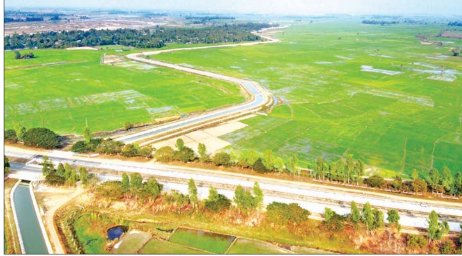
ဆွာချောင်းဆည်ရေသောက်စနစ်မှ ဆည်ရေပေးဝေမှု

စိုက်ပျိုးရေးများ ပေးဝေရာတွင် တည်ဆောက်ပြီး ဆည်ရေသောက်စနစ်များကို အဆင့်မြှင့်တင်ပြုပြင်ခြင်းဖြင့် စိုက်ပျိုးရေးများ အလေ့အလွင့်မရှိဘဲ လိုအပ်သည့်အချိန် တွင် လိုအပ်သလောက် ပေးဝေနိုင်ရန် ကြိုးပမ်းဆောင်ရွက်လျက်ရှိ