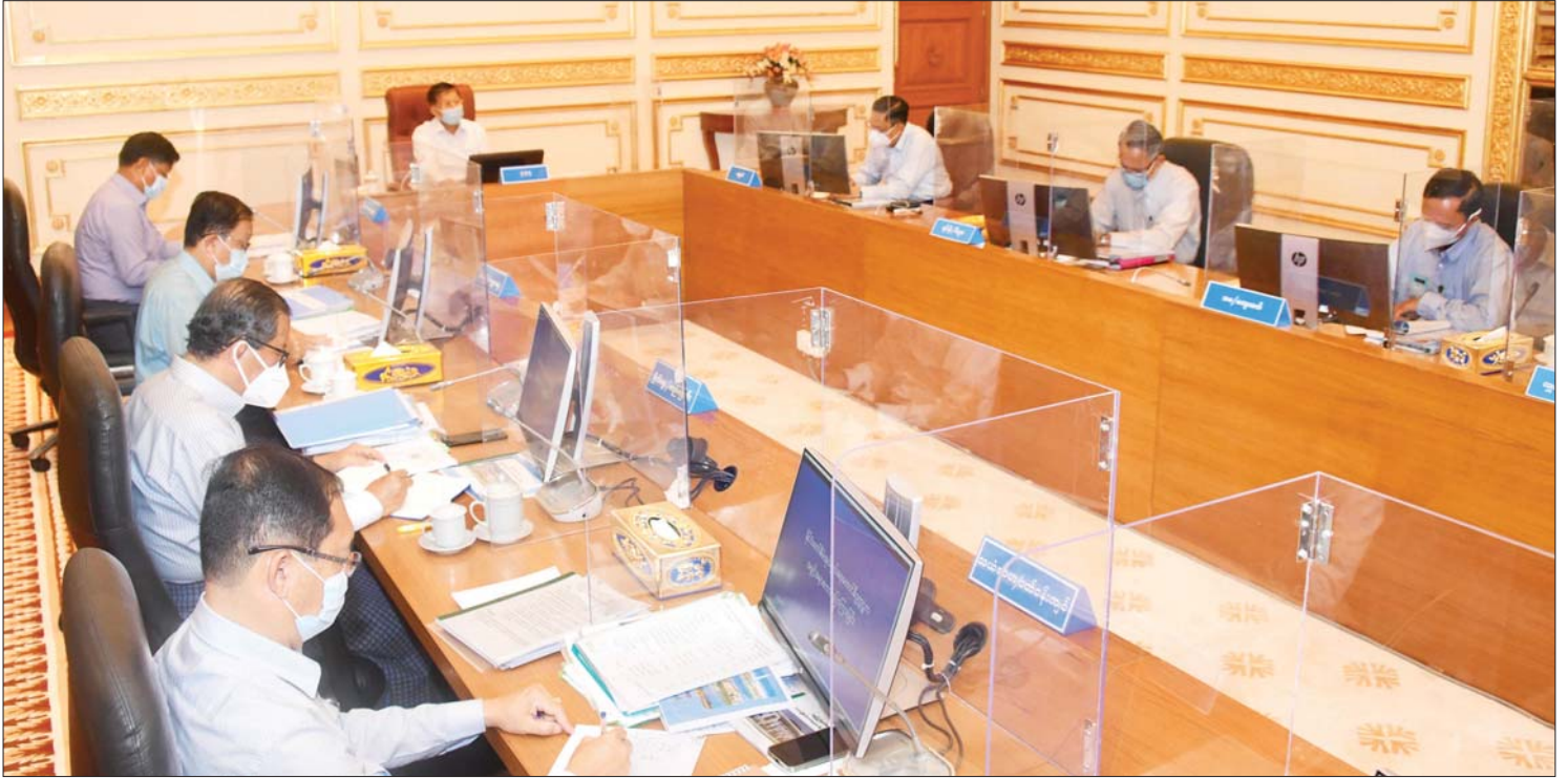
နိုင်ငံတော် စီမံအုပ်ချုပ်ရေးကောင်စီဥက္ကဋ္ဌ၊ ပြည်ထောင်စုသမ္မတမြန်မာနိုင်ငံတော် အိမ်စောင့်အစိုးရအဖွဲ့ နိုင်ငံတော်ဝန်ကြီးချုပ် ဗိုလ်ချုပ်မှူးကြီး မင်းအောင်လှိုင် ဩဂုတ် ၁၇ ရက်က ကျင်းပသည့် နေပြည်တော်မြို့တော် ဖွံ့ဖြိုးတိုးတက်ရေး အစည်းအဝေးတွင် အမှာစကားပြောကြားစဉ်။

ဩဂုတ်လ ၁ ရက်မှာ နိုင်ငံတော်စီမံ အုပ်ချုပ်ရေးကောင်စီရဲ့ ထူးခြားတဲ့