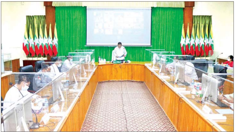
စင်စက်ရုံဝင်းအတွင်း အောက်ဆီဂျင်စက် ရောက်ရှိ ထားသည့် စက်သုံးလုံးဖြင့် လည်ပတ်မည်ဖြစ်ရာ တပ်ဆင်နေမှုကို ကြည့်ရှုစစ်ဆေးပြီး အဆိုပါ လိုအပ်မည့်အောက်ဆီဂျင်ပမာဏကို လုံလောက်စွာ အောက်ဆီဂျင်စက်သည် ပြည်နယ်အစိုးရအဖွဲ့ ဖြည့်ဆည်းပေးနိုင်မည်ဖြစ်ကြောင်း သိရသည်။ ရန်ပုံငွေကျပ် ၅၉၄ သန်းဖြင့် ဝယ်ယူတပ်ဆင် ခရိုင်(ပြန်/ဆက်)

မွန်ပြည်နယ် ကိုဗစ်-၁၉ရောဂါ ကာကွယ် ထိန်းချုပ်ရေးနှင့် အရေးပေါ်တုံ့ပြန်ရေးကော်မတီဥက္ကဋ္ဌ ပြည်နယ် ဝန်ကြီးချုပ် ဦးဇော်လင်းထွန်းနှင့် တာဝန်ရှိသူများသည် စက်တင်ဘာ ၁၀ ရက်က ပြည်နယ်အစိုးရအဖွဲ့ရုံး အောင်ဆန်းခန်းမ၌ ဗီဒီယိုကွန်ဖရင့်စနစ်ဖြင့် ကျင်းပသည့် ပြည်နယ် ကိုဗစ်-၁၉ရောဂါ ကာကွယ် ထိန်းချုပ် ကုသရေး လုပ်ငန်းညှိနှိုင်းအစည်းအဝေး တက်ရောက်သည်။ (ယာပုံ)