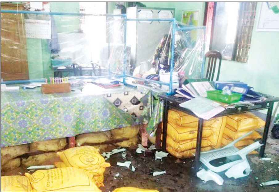
ဩဂုတ် ၁ ရက်က ရန်ကုန်တိုင်းဒေသကြီး မရမ်းကုန်းမြို့နယ်ရှိ ကိုဗစ်-၁၉ ကာကွယ်ဆေးထိုးလုပ်ငန်း ဆောင်ရွက်နေမှုကို အကြမ်းဖက်သမားများက လက်ပစ်ဗုံးဖြင့် ဖောက်ခွဲသဖြင့် ပျက်ဆီးသွားမှုများကို တွေ့ရစဉ်။

NUG အကြမ်းဖက်အဖွဲ့က အထက်ပါ အကြမ်းဖက်မှုလုပ်ရပ်များကို အရှိန်မြှင့် လုပ်ဆောင်နိုင်ရန် ရည်ရွယ်၍ ၂၀၂၁ ခုနှစ်၊ စက်တင်ဘာလ ၇ ရက်တွင် အရေးပေါ် ကြေညာချက်တစ်ရပ်ကို ထုတ်ပြန်ခဲ့ပါသည်။