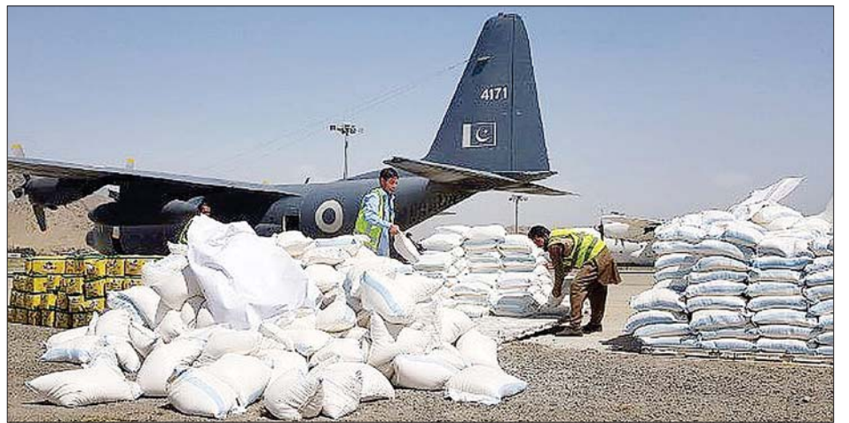
ဟာမစ်ကာဇိုင်းလေဆိပ်တွင် ထောက်ပံ့ရေးပစ္စည်းများကို သယ်ဆောင်နေသည်ကို တွေ့ရစဉ်။

နှင့် ချေးငှားခြင်းများ ပြုလုပ်နေရသည်ဟု မကျွေးနိုင်ဟု ၎င်းက ဆက်ပြောသည်။ အာဖဂန် နစ္စတန်တွင် ဩဂုတ် ၁၅ ရက်မတိုင်မီမှစတင်ကာ အစားအသောက် ဖူလုံမှုမရှိခြင်းနှင့် စတင်ကြုံတွေ့ လာရသည်ဟု ၎င်းက ပြောသည်။ ဆင်ဟွာ