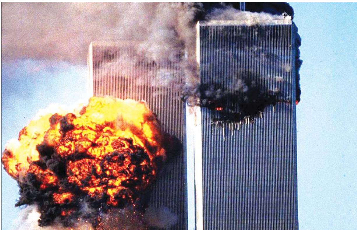
၂၀၀၁ ခုနှစ် စက်တင်ဘာ ၁၁ ရက်က အမေရိကန်ကမ္ဘာ့ကုန်သွယ်ရေးစင်တာကို အကြမ်းဖက်သမားများက လေယာဉ်ဖြင့် တိုက်ခိုက်မှုကြောင့် မီးလောင်မှုဖြစ်ပွားစဉ်။

အမေရိကန်တွေအတွက် အိုစမာဘင်လာဒင်ကိုရှာဖွေဖော်ထုတ်ပြီး သတ်ဖြတ်နိုင်ဖို့ဆိုတာ ဆယ်နှစ်နီးပါးကြာခဲ့ပါတယ်။ ၂၀၁၁ ခုနှစ်မှာ အိုစမာဘင်လာဒင်ကို သုတ်သင်ခဲ့တော့လည်း အာဖဂန်နစ္စတန်မှာ မဟုတ်ဘဲ ပါကစ္စတန်ရဲ့ မြို့စောင့်တပ်တွေရှိတဲ့ အဘော့တာဘတ်မှာ ဖြစ်ပါတယ်။ အမေရိကန်တပ်ဖွဲ့တွေဟာ အဲဒီမှာ အိုစမာဘင်လာဒင်ကို ညဘက်ဝင်ရောက်စီးနင်းပြီး သုတ်သင်နိုင်ခဲ့တာ ဖြစ်ပါတယ်။ အိုစမာဘင်လာဒင်ကို သုတ်သင်နိုင်ခဲ့ပြီး စစ်ဆင်ရေး အောင်မြင်ခဲ့တယ်