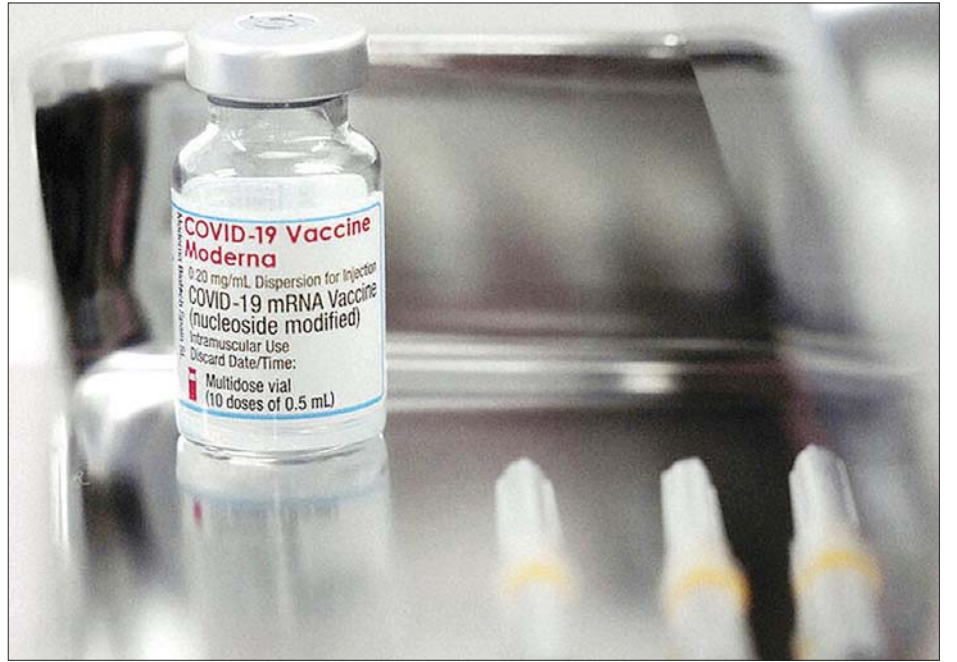
မော်ဒါနာ ကိုဗစ်-၁၉ ကာကွယ်ဆေး။