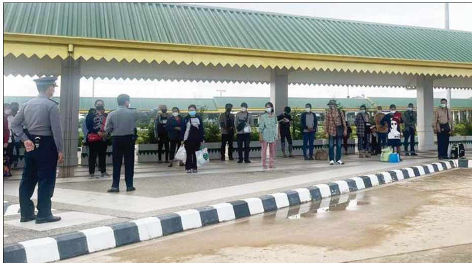
မြဝတီအမှတ် (၂) ချစ်ကြည်ရေးတံတားမှတစ်ဆင့် ပြန်လည်ဝင်ရောက်လာသည့် မြန်မာနိုင်ငံသားများကို တွေ့ရစဉ်။