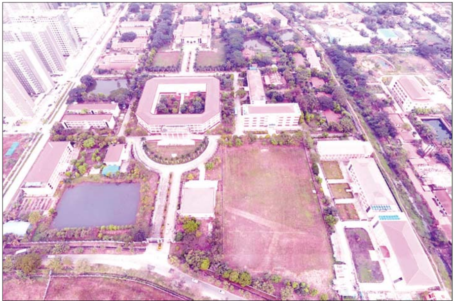
ပြည်ထောင်စုတိုင်းရင်းသားလူငယ်များ စွမ်းရည်ဖွံ့ဖြိုးရေးဒီဂရီကောလိပ် (ရန်ကုန်)။

တကျ နေထိုင်သင်ကြားရင်းပြည်ထောင်စုစိတ်ဓာတ်၊ တိုင်းရင်းသား စည်းလုံးညီညွတ်ရေး စိတ်ဓာတ်များ ရှင်သန်ထက်မြက်လာအောင် လေ့ကျင့်ပေးထောင် ပေးနေသော ကျောင်းတော်မဟာများ ဖြစ်ကြသည်။ သားသမီးများကို ဤကျောင်းတော်ကြီးများသို့ တက်ရောက်စေခြင်းဖြင့် မိဘများအတွက် အပေါင်း အသင်းကိစ္စ၊ စည်းကမ်းစနစ်တကျ နေထိုင်လုပ် ကိုင်တတ်ရေးကိစ္စ၊ စားဝတ်နေရေးကိစ္စ အစစ အရာရာ ပူပင်စရာ မရှိတော့ဘဲ ကျောင်းတော်ကြီးမှ ဆရာ၊ ဆရာမများ၏ သွန်သင်ဆုံးမမှု၊ ကျောင်းသား၊ ကျောင်းသူ၊ သင်တန်းသား၊ သင်တန်းသူအချင်းချင်း အပြန်အလှန် ထိန်းကျောင်းမှုတို့ကြောင့် သားသမီး များအတွက် လမ်းကြောင်းမှားသွားမှာကို မပူပင်ရ သလို ကျောင်းပြီးသွားသည့်အခါမှာလည်း နိုင်ငံ ဝန်ထမ်းများအဖြစ် တာဝန်ပေးခန့်အပ်ပေးသဖြင့် မိဘများအတွက် ရေကန်အသင့် ကြာအသင့်ပင် ဖြစ်ပေတော့သည်။ ဤကဲ့သို့ ဂုဏ်ရှိန်ထည်ဝါ ကြီးမားလှသော ကျောင်းတော်မဟာများကို ယခင် ကတည်းက ကျွန်တော် လေးစားခဲ့သည်။ ယခုရော နောင်ရော လေးစားနေဦးမည်။ ကျောင်းတော်ကြီး များ၏ လေ့ကျင့်ပေးထောင်ပေးမှုအပေါ် သံယောဇဉ် ကြီးမားခဲ့ရသည်။ ဟော...ယခုလည်း ရပ်ကျိုး၊ ရွာကျိုး၊ မြို့နယ်အကျိုး၊ တိုင်း ဒေသကြီး အကျိုးနှင့်ယှဉ်၍ ကျောင်းတော်ကြီး တို့အပေါ် သံယောဇဉ်ကြီးတို့က တိုး၍ တိုး၍ နှောင့်ဖွံ့ မိပါပကောလား ...။ ခြေ... သံယောဇဉ်တွေ လွန်းတင်ခဲ့ပါပေ။ ဤကျောင်းတော်မဟာကြီး တွေ ...။