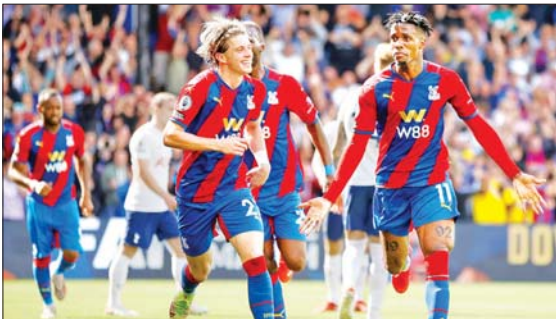
ဂိုးသွင်းယူပြီး ပဲလေ့စ်ကစားသမားများ အောင်ပွဲခံနေစဉ်။

ပရီမီယာလိဂ်ပွဲစဉ် (၄)မှ အစောဆုံးပွဲစဉ်အဖြစ် ခရစ္စတယ်ပဲလေ့စ်အသင်းနှင့် စပါးအသင်းတို့ပွဲစဉ် ကို စနေနေ့ညပိုင်းက ပဲလေ့စ်အိမ်ကွင်း၌ ယှဉ်ပြိုင် ကစားခဲ့ရာ ပဲလေ့စ်အသင်းက သုံးဂိုး-ဂိုး မရှိဖြင့် စပါးအသင်းကို အနိုင်ရရှိခဲ့သည်။