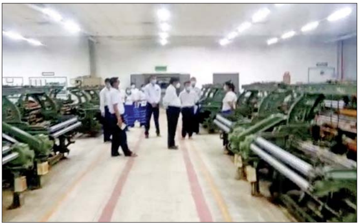
ပြည်ထောင်စု ဝန်ကြီး ဒေါက်တာ ချာလီသန်း ပခုက္ကူမြို့ရှိ အမှတ်(၅) အထည်စက်ရုံ အား ကြည့်ရှု စစ်ဆေးစဉ်။

မွန်းလွဲပိုင်းတွင် ပြည်ထောင်စုဝန်ကြီးသည် မကွေးတိုင်းဒေသကြီး ပခုက္ကူမြို့ရှိ အမှတ်(၅) အထည်စက်ရုံနှင့် အမှတ်(၁၁)အထည်စက်ရုံတို့သို့ ရောက်ရှိပြီး စက်ရုံအတွင်း စက်ပစ္စည်းများ တပ်ဆင်