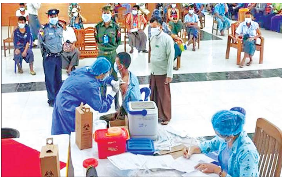
ဦးတို့ကိုလည်းကောင်း၊ ပဲခူးတိုင်းဒေသကြီးအတွင်းရှိ မြို့နယ်လေးမြို့နယ်မှ သံဃာတော်များ၊ ၆၅ နှစ်နှင့် အထက် သက်ကြီးဘိုးဘွားများ၊ ဌာနဆိုင်ရာဝန်ထမ်း များနှင့် ပြည်သူစုစုပေါင်း ၂၃၆၀ တို့ကိုလည်းကောင်း တပ်မတော်မှ ဆေးအဖွဲ့များက ပြည်သူ့ဆေးရုံများမှ ဆရာဝန်များ၊ သက်ဆိုင်ရာ ကျန်းမာရေးဝန်ထမ်းများ၊ စေတနာ့ဝန်ထမ်းများနှင့် ပူးပေါင်း၍ ကိုဗစ်- ၁၉ ရောဂါ ကာကွယ်ဆေးထိုးနှံပေးခြင်းများ ဆောင်ရွက် ပေးသည်။ ယင်းသို့ဆောင်ရွက်ပေးနေမှုများကို သက်ဆိုင်ရာ တိုင်းစစ်ဌာနချုပ်များမှ တာဝန်ရှိသူများက သွား ရောက်ကြည့်ရှုအားပေးပြီး လိုအပ်သည်များ ညှိနှိုင်း ဆောင်ရွက်ပေးခဲ့ကြောင်း သိရသည်။ သတင်းစဉ်

သစ် (ဆိပ်ကမ်း)မြို့နယ်များအတွင်းရှိ သံဃာတော် များ၊ သာသနာ့နွယ်ဝင်သီလရှင်များ၊ ၆၅ နှစ်နှင့် အထက် သက်ကြီးဘိုးဘွားများ၊ ဌာနဆိုင်ရာဝန်ထမ်း များနှင့် ပြည်သူစုစုပေါင်း ၇၂၉ ဦးတို့ကိုလည်းကောင်း၊ ဧရာဝတီတိုင်းဒေသကြီးအတွင်းရှိ မြို့နယ် ၁၃ မြို့ နယ်မှ သံဃာတော်များ၊ ၆၅ နှစ်နှင့်အထက် သက်ကြီး ဘိုးဘွားများ၊ စေတနာ့ဝန်ထမ်းများ၊ ဌာနဆိုင်ရာ ဝန်ထမ်းများနှင့် ပြည်သူစုစုပေါင်း ၄၆၅၂ ဦးတို့ကို လည်းကောင်း၊ ရခိုင်ပြည်နယ် စစ်တွေမြို့နယ်အတွင်း ရှိ ကယ်ဆယ်ရေးစခန်းများမှ ဘင်္ဂါလီလူမျိုး ၂၄၂ ဦး၊ ရခိုင်ပြည်နယ်နှင့် ချင်းပြည်နယ်အတွင်းရှိ မြို့နယ် ခုနစ်မြို့နယ်မှ သံဃာတော်များ၊ စေတနာ့ဝန်ထမ်း များ၊ ဌာနဆိုင်ရာဝန်ထမ်းများ၊ တိုက်ပွဲရှောင်ပြည်သူ များနှင့် ဒေသခံပြည်သူ စုစုပေါင်း ၄၁၅၅ ဦးတို့ကို လည်းကောင်း၊ စစ်ကိုင်းတိုင်းဒေသကြီးအတွင်းရှိ မြို့နယ်သုံးမြို့နယ်မှ သံဃာတော်များ၊ သာသနာ့ နွယ်ဝင်သီလရှင်များ၊ ၆၅ နှစ်နှင့်အထက် သက်ကြီး ဘိုးဘွားများ၊ ဌာနဆိုင်ရာဝန်ထမ်းများနှင့် ပြည်သူ စုစုပေါင်း ၁၅၀၈ ဦးတို့ကိုလည်းကောင်း၊ မန္တလေး တိုင်းဒေသကြီးအတွင်းရှိ ခရိုင်ခုနစ်ခုတို့မှ သံဃာ တော်များ၊ ၆၅ နှစ်နှင့်အထက် သက်ကြီးဘိုးဘွားများ၊ ဌာနဆိုင်ရာဝန်ထမ်းများနှင့် ပြည်သူစုစုပေါင်း ၉၅၄၂