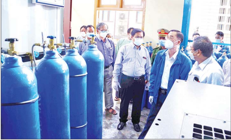
အခြေအနေများကို မေးမြန်းခဲ့ရာ ပြည်နယ်စက်မှု သည်။ ထို့နောက် ပြည်နယ်ဝန်ကြီးချုပ်နှင့် တာဝန် ရှိသူများသည် အောက်ဆီဂျင်စက်လည်ပတ်နေမှု၊

ကယားပြည်နယ် ဝန်ကြီးချုပ်နှင့် တာဝန်ရှိသူများ သည် ၂၀၂၀ - ၂၀၂၁ ဘဏ္ဍာနှစ်တွင် ကယားပြည်နယ် အစိုးရအဖွဲ့၏ လျှို့ဝှက်ထောက်ပံ့ငွေဖြင့် လွိုင်ကော် ပြည်သူ့ဆေးရုံကြီးတွင် တည်ဆောက်ထားသည့် အောက်ဆီဂျင်စက်မှ တစ်နေ့လျှင် အောက်ဆီဂျင် လီတာအိုး ၄၀ အလုံး ၁၀၀ ထုတ်လုပ်နေမှုအခြေ အနေကို ယနေ့နံနက် ၉ နာရီက သွားရောက် စစ်ဆေးကြည့်ရှုခဲ့သည်။ (ယာပုံ)