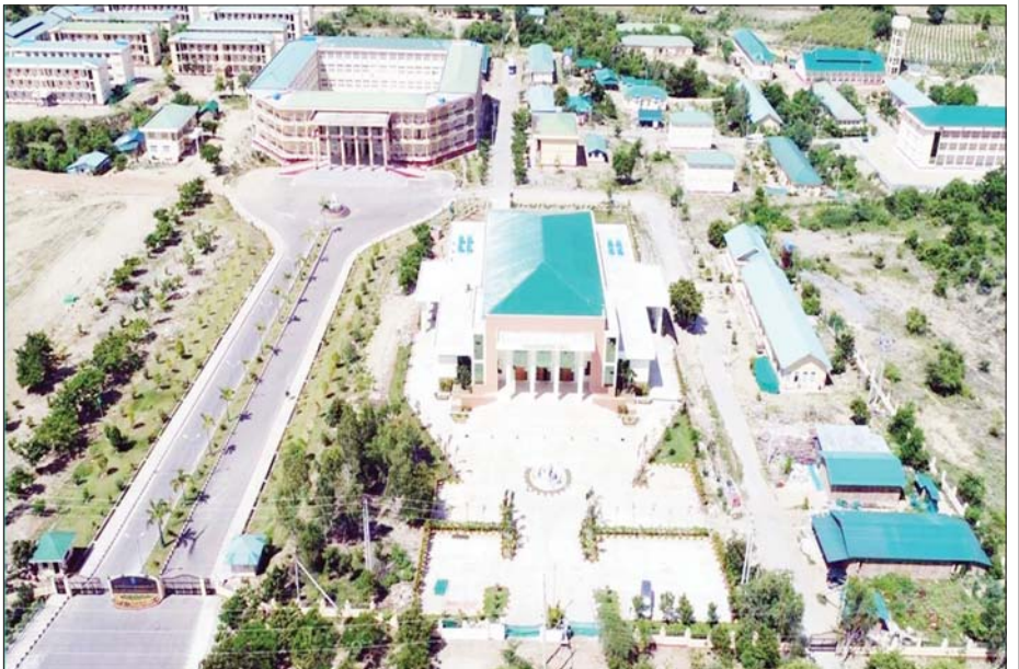
ပြည်ထောင်စုတိုင်းရင်းသားလူငယ်များ စွမ်းရည်ဖွံ့ဖြိုးရေးဒီဂရီကောလိပ် (စစ်ကိုင်း)။