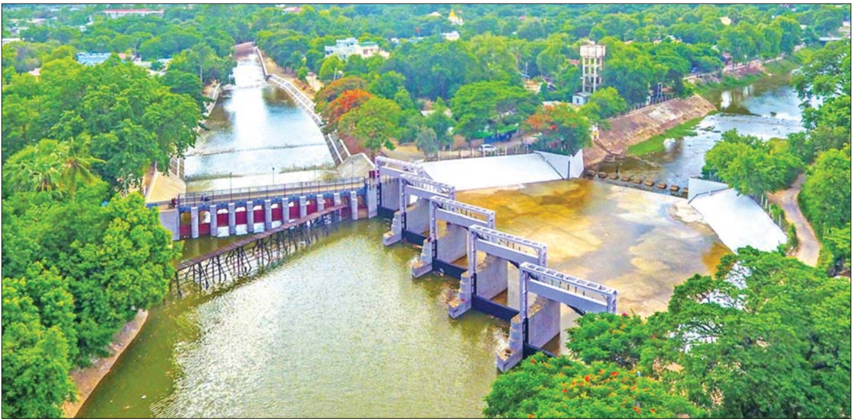
ဇီးတောရေလွှဲဆည်

ထို့အတူ ဂျပန်နိုင်ငံ(ODA)ချေးငွေဖြင့် စစ်ကိုင်းတိုင်းဒေသကြီး အတွင်းရှိ သဖန်းဆိပ် ဆည်ရေသောက်စနစ် အဆင့်မြှင့်တင်ပြုပြင်ခြင်း လုပ်ငန်းများသည် ဆောင်ရွက်ဆဲဖြစ်ပြီး လုပ်ငန်းပြီးစီးပါက မူလ ဆည်ရေသောက်ဧရိယာ ၄၆ သိန်းခန့်ကို စိုက်ပျိုးရေးလုံလောက်စွာ ပေးဝေကာ ဒေသခံတောင်သူများ၏ လူမှုစီးပွားဘဝများကို အထောက် အကူပြုနိုင်မည်ဖြစ်သည်။ အလားတူ ဆည်မြောင်းနှင့် ရေအသုံးချမှု စီမံခန့်ခွဲရေးဦးစီးဌာနက ဆောင်ရွက်နေဆဲဖြစ်သည့် ဖြူးနှင့် မဒန်း ဆည်ရေသောက်စနစ်များပြီးစီးပါက လယ်မြေဧက ခုနစ်သောင်း ကျော် အကျိုးပြုနိုင်မည်ဖြစ်သည့်အပြင် တောင်သူများ၏ လယ်မြေ