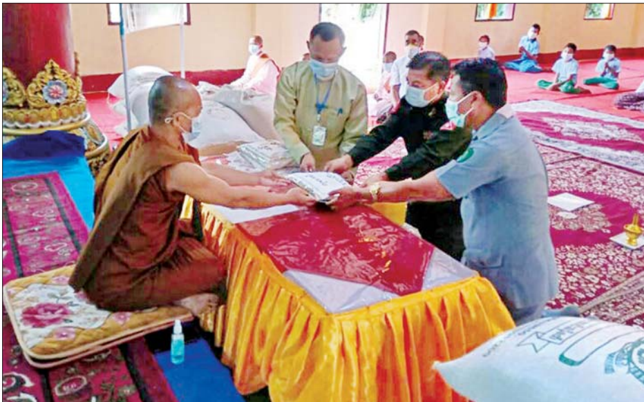
အတွင်း ကိုဗစ်စင်တာများတွင် သော လူနာများအတွက် ဆေးဝါး ကို ထောက်ပံ့ပေးအပ်လှူဒါန်းခဲ့ ထို့နောက် မိုင်းဆတ်မြို့နယ် တက်ရောက်ဆေးကုသမှု ခံယူနေ နှင့် အင်အားပြည့်အစားအစာများ ကြောင်း သိရသည်။ သတင်းစဉ်

မိုင်းဆတ် စက်တင်ဘာ ၁၁ နယ်စပ်ရေးရာဝန်ကြီးဌာန နယ်စပ်ဒေသနှင့် တိုင်းရင်းသားလူမျိုးများ ဖွံ့ဖြိုးတိုးတက်ရေး ဦးစီးဌာနက ယနေ့ နံနက်ပိုင်းတွင် ရှမ်းပြည်နယ်(အရှေ့ပိုင်း) မိုင်းဆတ်မြို့နယ် သဗ္ဗညု ဘုန်းတော်ကြီးကျောင်းရှိ ရဟန်း၊ သာမဏေ၊ သီလရှင်များ အတွက် ဆွမ်းဆန်တော် ၂၁ အိတ်၊ ဆီ ၆၆ ပိဿာခွဲ၊ ကုလားပဲ ၁၃၃ ပိဿာတို့ကို လှူဒါန်းရာ ကာကွယ်ရေးဝန်ကြီးဌာနမှ ဗိုလ်မှူးကြီးလင်းအောင်မိုး၊ မိုင်းဆတ်ခရိုင်စီမံအုပ်ချုပ်ရေးအဖွဲ့ဥက္ကဋ္ဌ တာဝန်ရှိသူများ တက်ရောက်လှူဒါန်းကြသည်။