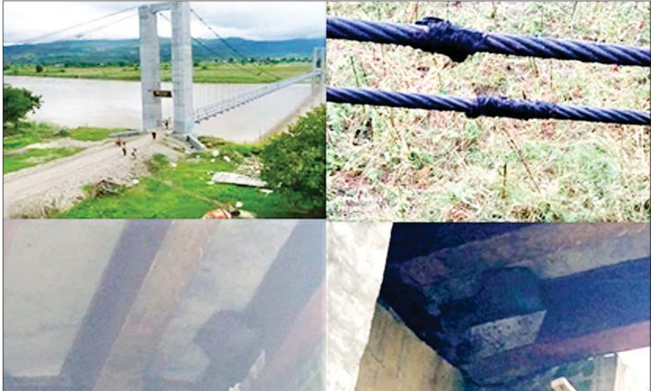
စစ်ကိုင်းတိုင်းဒေသကြီး ကလေးမြို့နယ်၌ PDF အကြမ်းဖက်အဖွဲ့မှ မြစ်သာမြစ်ကူး ကြိုးတံတားကို မိုင်းခွဲဖျက်ဆီးမှုကြောင့် ပျက်စီးမှုကို တွေ့ရစဉ်။

အဆိုပါ PDF အကြမ်းဖက်အဖွဲ့များ မိုင်းထောင် ဖောက်ခွဲဖျက်ဆီးခဲ့သည့် ကြိုးတံတားကို အမြန်ဆုံး ပြုပြင်၍ လမ်းပန်းဆက်သွယ်မှု ပြန်လည်ကောင်းမွန်စေရေး လုံခြုံရေးတပ်ဖွဲ့ဝင်များနှင့် ဌာနဆိုင်ရာ တာဝန်ရှိသူများပါဝင်သော ပူးပေါင်းအဖွဲ့က အချိန်နှင့်တစ်ပြေးညီ ပြန်လည်ပြင်ဆင် ဆောင်ရွက်လျက် ရှိကြောင်း သိရသည်။