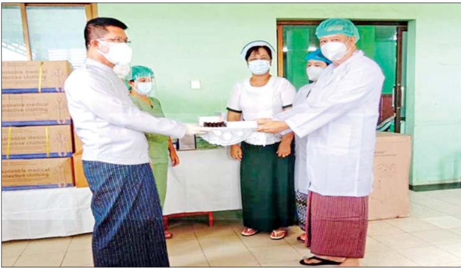
မြို့နယ်ပြည်သူ့ဆေးရုံသို့ Oxygen ၀တီစုံ ၁၀၀၊ Mask အခု ၆၀၀၀၊ လည်းကောင်း၊ လေးမျက်နှာ Concentrator နှစ်လုံး၊ PPE အလှူငွေ ငါးသိန်းကျပ်ကို မြို့ရှိပြည်သူ့ဆေးရုံနှင့် အိုင်သပြု

နေပြည်တော် စက်တင်ဘာ ၁၁ ကိုဗစ်-၁၉ ရောဂါတတ်ခွဲအတည် ပြု ပိုးတွေ့လူနာများနှင့် သီးသန့် စောင့်ကြည့်ရမည့် သူများကို ကုသရေးလုပ်ငန်းများ ဆောင်ရွက် ရာတွင် အောက်ဆီဂျင်လိုအပ် ချက်များကို တစ်ဖက်တစ်လမ်းမှ အထောက်အကူပြုစေရန်အတွက် တပ်မတော်နှင့် အလှူရှင်များက အောက်ဆီဂျင်အိုးများ၊ ရောဂါ ကာကွယ်ရေး အထောက်အကူပြု ပစ္စည်းများနှင့် အာဟာရဖြည့် စားသောက်ဖွယ်ရာများကို လှူဒါန်း ပေးလျက်ရှိရာ ယနေ့တွင် ဧရာ ဝတီတိုင်းဒေသကြီး ဒေးဒရဲမြို့