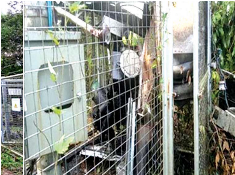
စက်တင်ဘာ ၅ ရက်က မန္တလေးတိုင်းဒေသကြီး စဉ့်ကူးမြို့နယ် ကျည်တောက်ပေါက်ကျေးရွာ၌ စိုက်ထူထားသည့် Ooredoo ဆက်သွယ်ရေးတာဝါတိုင်၏ အထိုင်စက်ပုံးကို အကြမ်းဖက်သမားများက မီးရှို့ဖျက်ဆီးထားစဉ်။

အဆိုပါ ထုတ်ပြန်ချက်တွင် “နိုင်ငံတော်စီမံအုပ်ချုပ်ရေးကောင်စီ၏ အဓိကထောက်တိုင်များကို ပစ်မှတ်ထားတိုက်ခိုက်ရန်၊ အုပ်ချုပ်ရေးမှူးများ အလုပ်မှချက်ချင်းနုတ်ထွက်ရန်၊ ပြည်သူများအား မလိုအပ်ဘဲ ခရီးသွားလာခြင်းမပြုရန်နှင့် ဝန်ထမ်းများ ရုံးမတက်ရန်” ဟူသော အချက်များဖြင့် ပြည်သူလူထုအား အဓမ္မခြိမ်းခြောက်ထားသည်ကို တွေ့ရှိရပါသည်။ ၎င်းတို့၏ ထုတ်ပြန်ချက်သည် ကိုဗစ်-၁၉ ကပ်ရောဂါ ဘေးကို တုံ့ပြန်ရန်ဆိုင်ရာသော ပြည်သူလူထု၏ လူမှုစီးပွားဘဝများကို ပိုမိုဆိုးရွားစေပြီး နိုင်ငံတော် တည်ငြိမ်အေးချမ်းရေးကို ထိခိုက်ပျက်ပြားစေသည့်အပြင် အေးချမ်းစွာနေထိုင်လိုသော ပြည်သူလူထု အတွက် စိုးရိမ်ထိတ်လန့်မှုများ ဖြစ်ပေါ်စေသည့် အကြမ်းဖက်လှုံ့ဆော်မှုများဖြစ်ကြောင်း တွေ့ရှိရပါသည်။