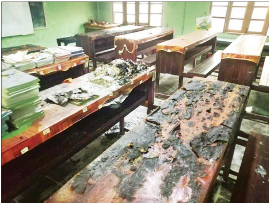
ဇွန် ၁၄ ရက်က ရန်ကုန်တိုင်းဒေသကြီးအတွင်းရှိ မူလတန်းကျောင်း တစ်ကျောင်းကို အကြမ်းဖက်သမားများက မီးရှို့ဖျက်ဆီးထားစဉ်။

ကမ္ဘာ့နိုင်ငံအသီးသီးတွင် အကြမ်းဖက်မှုများကို တိုက်ဖျက်ရာ၌ အကြမ်းဖက်မှုကို မလိုလားသည့် ပြည်သူများက သက်ဆိုင်ရာနိုင်ငံအစိုးရများနှင့် ဝိုင်းဝန်းပူးပေါင်း ဆောင်ရွက်ကြသလို မိမိတို့နိုင်ငံတွင်လည်း မိဘပြည်သူများအနေဖြင့် နိုင်ငံတော်တည်ငြိမ်အေးချမ်းရေးအတွက် အကြမ်းဖက်သမားများအား ဖော်ထုတ်ဖမ်းဆီးရမိစေရေး သက်ဆိုင်ရာသို့ လျှို့ဝှက်သတင်းပေးပို့ခြင်းဖြင့် ဆက်လက်ပူးပေါင်းဆောင်ရွက်ပေးကြပါရန် မေတ္တာရပ်ခံအသိပေးနှိုးဆော်အပ်ပါသည်။