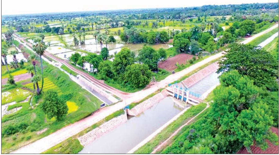
မြောက်ယမားဆည်ရေသောက်စနစ်မှ ဆည်ရေပေးဝေမှု