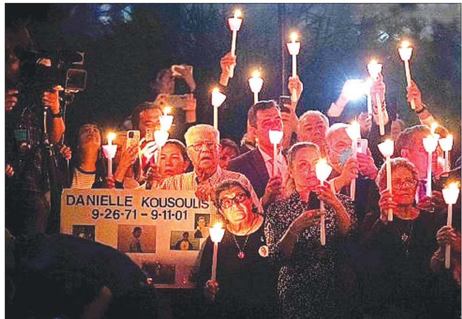
၉/၁၁ တိုက်ခိုက်ခံရမှုတွင် သေဆုံးခဲ့ရသူများအတွက် အောက်မေ့သတိရဖွယ် အခမ်းအနားကို နယူးယောက်မြို့တွင် ပြုလုပ်နေစဉ်။

နယူးယောက် စက်တင်ဘာ ၁၁ ရက်တွင် အကြမ်းဖက်တိုက်ခိုက် အခမ်းအနားကို စက်တင်ဘာ ၁၀ အမေရိကန် ပြည်ထောင်စုတွင် မှုအတွင်း သေဆုံးခဲ့ရသူများ ရက်တွင် ပြုလုပ်ခဲ့ပြီး အနစ် ၂၀ ၂၀၀၁ ခုနှစ် စက်တင်ဘာ ၁၁ အတွက် အောက်မေ့သတိရဖွယ် ပြည့်သွားပြီဖြစ်သည်။