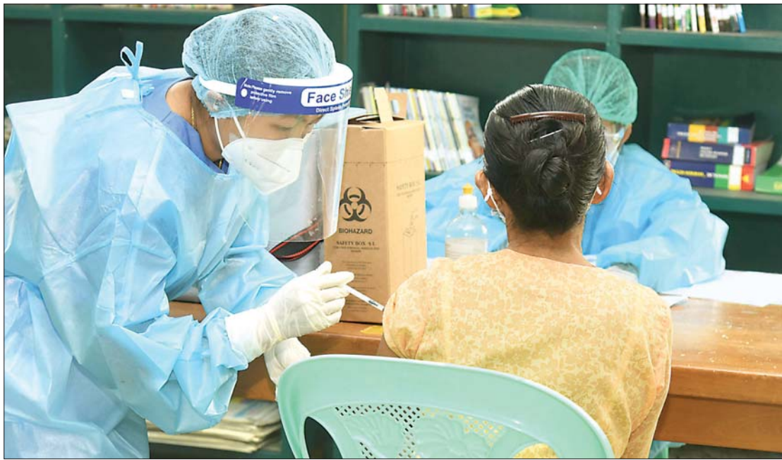
ပြည်သူများအား ကိုဗစ်-၁၉ ကာကွယ်ဆေးထိုးနှံပေးစဉ်။

ကာကွယ်ဆေးထိုးနှံမှု လုပ်ငန်းစဉ် တွေနဲ့ လက်ရှိအခြေအနေ၊ စာသင် ကျောင်းများ ပြန်လည်ဖွင့်လှစ်ချိန်မှာ ကျန်းမာရေးစောင့်ရှောက်မှု လိုအပ်ချက် တွေကို ကြိုတင်ပြင်ဆင်ပေးနေတဲ့ အခြေအနေ၊ ကိုဗစ်လှိုင်းများရဲ့ ရိုက်ခတ် မှုတွေကနေ သင်ခန်းစာရယူကာ ဆေးရုံ တွေအားလုံးမှာ ကုသရေးအတွက် အမြဲကြိုတင်ပြင်ဆင်ရမယ့် အခြေအနေ၊ ဆေးဝါးအတုများ ဖြန့်ဖြူးရောင်းချတာ၊ ဈေးကစားတာတွေကို တားမြစ်နိုင်ခဲ့တဲ့ အတွက် ပြည်သူများ ဈေးနှုန်းမှန်ကန်စွာ ဝယ်ယူနိုင်ခဲ့တဲ့ အခြေအနေ၊ အသက် ၆၅ နှစ်နှင့်အထက် ပြည်သူများ၊ ပရဟိတ အသင်းအဖွဲ့ဝင်များ၊ စက်ရုံ၊ အလုပ်ရုံ အလုပ်သမားများ၊ အကျဉ်းသူ၊ အကျဉ်း သားများ၊ လမ်းပန်းဆက်သွယ်ရေး ခက်ခဲတဲ့ ဒေသများ၊ တိုင်းရင်းသား လက်နက်ကိုင်အဖွဲ့များရဲ့ ဒေသများ၊ တိုက်ပွဲရှောင်ဒေသများနဲ့ IDP camp များစတဲ့ အလွှာပေါင်းစုံဒေသပေါင်းစုံက ပြည်သူများအားလုံးကို ကာကွယ် ဆေးထိုးနှံပေးခြင်း၊ ကာကွယ်ဆေးထိုးနှံ နိုင်ရန် စီစဉ်ဆောင်ရွက်ခြင်းတွေကို လည်း အားရဖွယ်မြင်တွေ့ရပါတယ်။