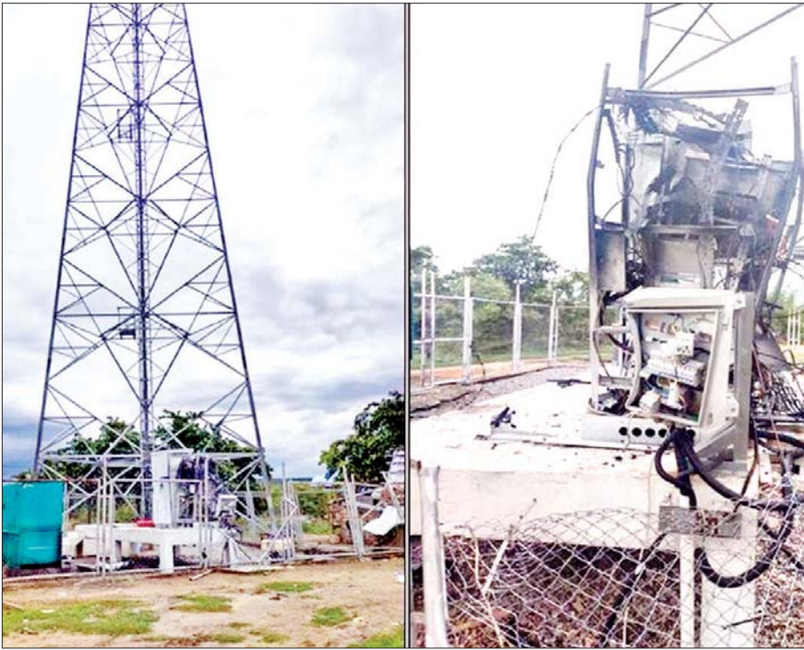
စက်တင်ဘာ ၅ ရက်က မန္တလေးတိုင်းဒေသကြီး မတ္တရာမြို့နယ်ရှိ Ooredoo ဆက်သွယ်ရေးတာဝါတိုင် အောက်ခြေရှိ စက်ပုံးအား အကြမ်းဖက်သူများ မိုင်းထောင်ဖောက်ခွဲထားသည်ကို တွေ့ရစဉ်။