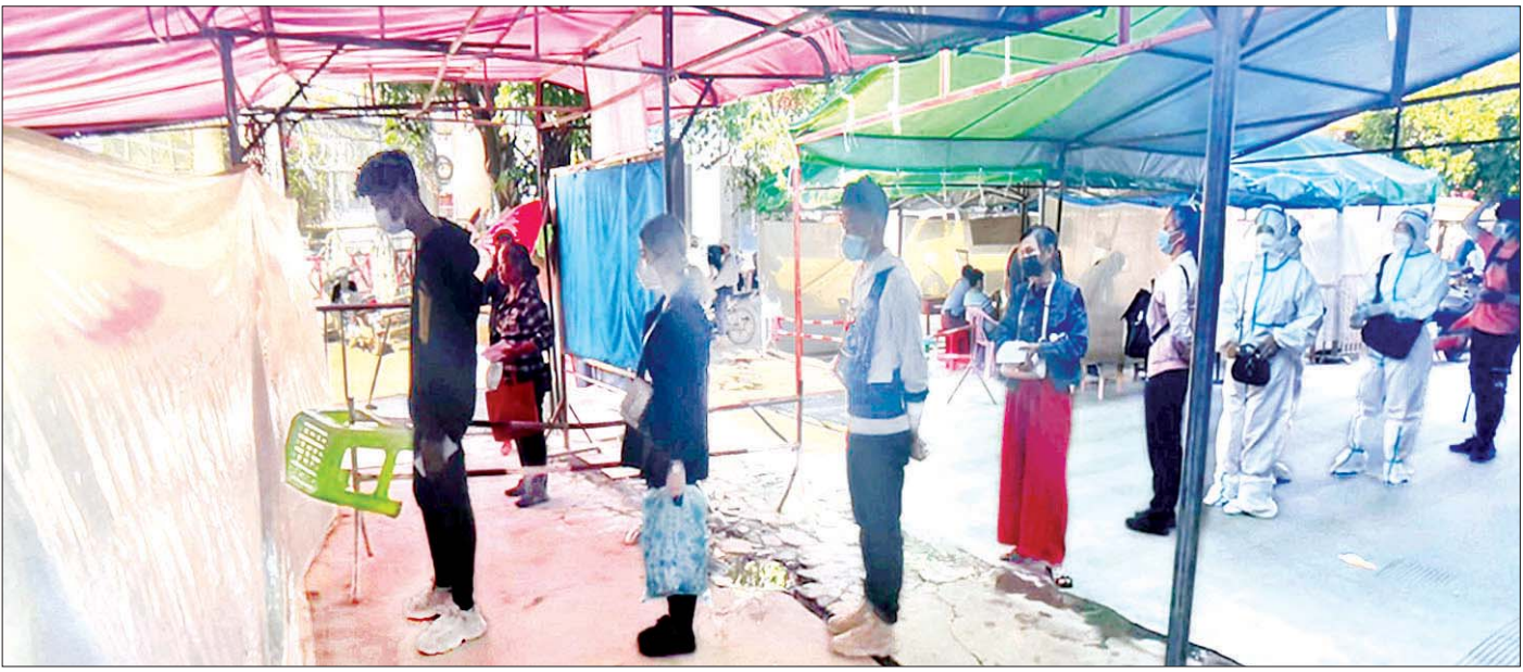
တရုတ်နိုင်ငံမှ ပြန်လည်ဝင်ရောက်လာသည့် မြန်မာနိုင်ငံသားများအား နှစ်နိုင်ငံနယ်စပ် စစ်ဆေးရေးဂိတ်တွင် ကိုဗစ်-၁၉ ရောဂါ ရှိ၊ မရှိ စစ်ဆေးစဉ်။

ပြည်ပနိုင်ငံများမှ ဝင်ရောက်လာသည့် မြန်မာနိုင်ငံ သားများကို နယ်စပ်ဂိတ်အသီးသီးတွင် လက်ခံဆောင်ရွက်ပေးလျက်ရှိရာ စက်တင်ဘာ ၁၀ ရက် တွင် ရှမ်းပြည်နယ်မြောက်ပိုင်း မူဆယ်မြို့ မြန်မာ-တရုတ် နှစ်နိုင်ငံနယ်စပ် နန်းတော်စစ်ဆေးရေးဂိတ်မှ အမျိုးသား ၁၅ ဦး၊ အမျိုးသမီး ၁၉ ဦး စုစုပေါင်း ၃၄ ဦး၊ မြန်မာ-တရုတ် နှစ်နိုင်ငံနယ်စပ်၊ နမ့်ဖာဟော် တံတားမှ အမျိုးသမီး နှစ်ဦးနှင့် ရန်လုံကျိုင်းတံတား မှ အမျိုးသား ခြောက်ဦး၊ အမျိုးသမီး ငါးဦး စုစုပေါင်း ၁၁ ဦးတို့ကိုလည်းကောင်း၊ ရှမ်းပြည်နယ်အရှေ့ပိုင်း တာချီလိတ်မြို့ ဝမ်ပုံဆိပ်ကမ်းမှ အမျိုးသား ၁၁၉ ဦး၊ အမျိုးသမီး ၈၁ ဦး စုစုပေါင်း ၂၀၀ တို့ကို လည်းကောင်း အသီးသီးလက်ခံခဲ့သည်။