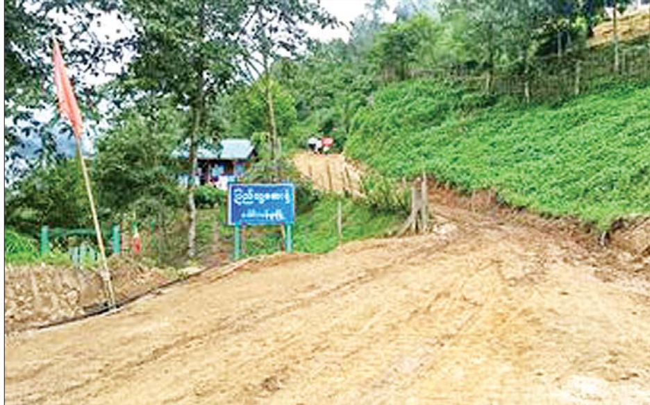
ကချင်ပြည်နယ် ပူတာအိုခရိုင် ခေါင်လန်ဖူးမြို့နယ် မဂ္ဂဇ - ခေါင်လန်ဖူးလမ်းဖောက်လုပ်ခြင်းစီမံကိန်း၌ ဖောက်လုပ်ပြီးစီးသည့် လမ်းပိုင်းအခြေအနေကို တွေ့ရစဉ်။