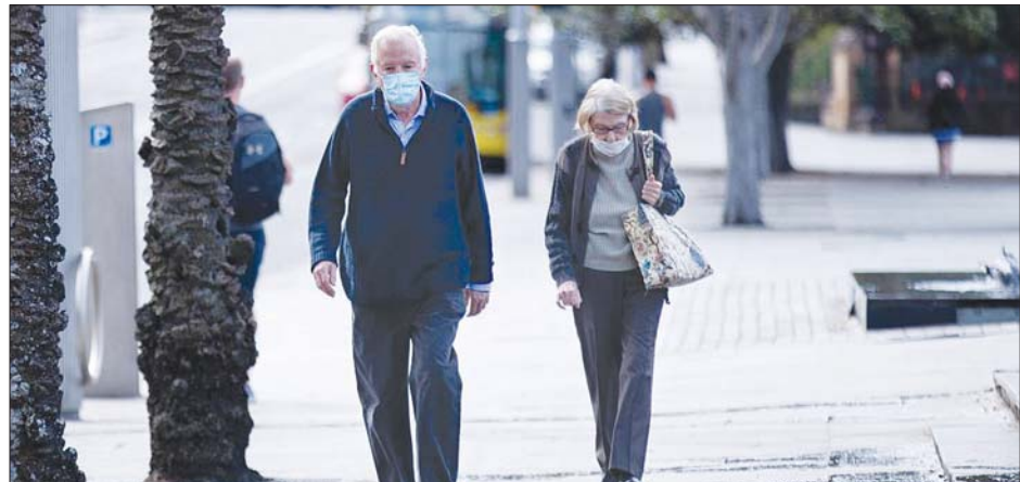
ဆစ်ဒနီမြို့လမ်းမထက်တွင် လမ်းသွားနေသူတချို့ကို တွေ့ရစဉ်။

စက်တင်ဘာ ၆ ရက် နံနက် ပိုင်းတွင် ဒေသတွင်း ကူးစက်ခံရ သူ ၁၅၃၈ ဦး ထပ်မံတွေ့ရှိခဲ့ပြီး လက်ရှိတိုင်းပြည်အတွင်း ရောဂါ ဖြစ်ပွားနေသူဦးရေမှာ ၂၆၀၀၀