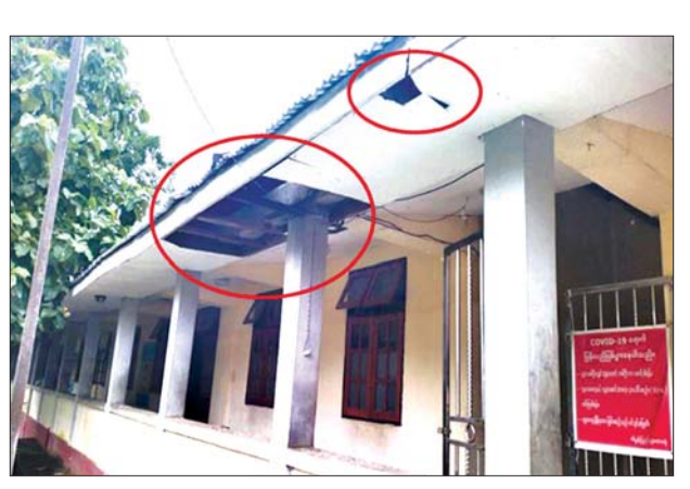
KNLA တပ်မဟာ(၅)အဖွဲ့၏ ပစ်ခတ်မှုကြောင့် ခရိုင်ပြည်သူ့ဆေးရုံ (ဖာပွန်)ရှိ အဆောက်အအုံ ပျက်စီးမှုကို တွေ့ရစဉ်။

နေပြည်တော် စက်တင်ဘာ ၆ KNLA တပ်မဟာ (၅) အဖွဲ့က လက်နက်ကြီး၊ လက်နက်ငယ်များဖြင့် လာရောက်ပစ်ခတ်မှုကြောင့် ဖာပွန်ခရိုင် ပြည်သူ့ဆေးရုံ၌ ကိုဗစ်-၁၉ ရောဂါဖြင့် တက်ရောက် ကုသမှုခံယူလျက်ရှိသည့် အသက် ၇၈ နှစ်အရွယ် အဘွားအို တစ်ဦး ထိခိုက်ဒဏ်ရာရရှိခဲ့ကြောင်း သိရသည်။ ဖြစ်စဉ်မှာ ကရင်ပြည်နယ် ဖာပွန်မြို့တွင်း မြို့လုံခြုံရေးဆောင်ရွက်လျက်ရှိသော လုံခြုံရေး တပ်ဖွဲ့ဝင်များအား ယနေ့ နံနက် ၁၀ နာရီခွဲခန့်တွင် KNLA တပ်မဟာ(၅)အဖွဲ့က ဆေးရုံ၏ အရှေ့မြောက်ဘက်မှ လက်နက်ကြီး၊ လက်နက်ငယ်များဖြင့် လာရောက် နှောင့်ယှက်ပစ်ခတ်တိုက်ခိုက်ခဲ့သဖြင့် လုံခြုံရေးတပ်ဖွဲ့ဝင်များက ပြန်လည်ခုခံပစ်ခတ်ခဲ့ရာ KNLA တပ်မဟာ(၅) အဖွဲ့သည် အရှေ့ဘက်သို့ ဆုတ်ခွာ