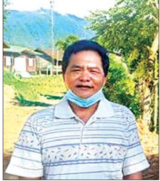
ဦးပဇယ်ဖူ