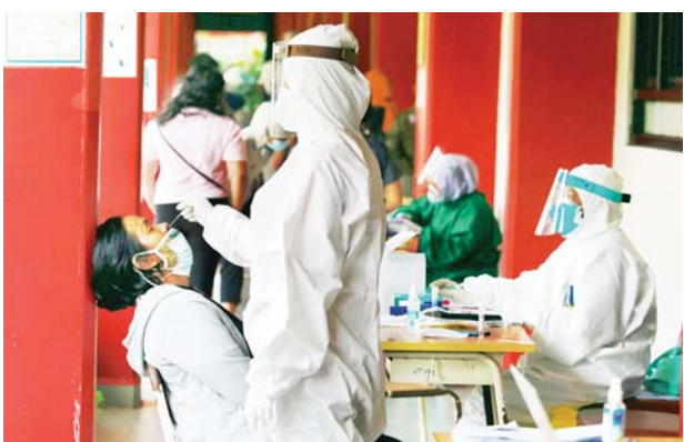
အင်ဒိုနီးရှားနိုင်ငံ ဂျကာတာမြို့ရှိ စာသင်ကျောင်းတစ်ကျောင်းတွင် ကျန်းမာရေးဝန်ထမ်းတစ်ဦးက ကိုဗစ်-၁၉ စစ်ဆေးရန် နှာခေါင်းတို့ဖတ် နမူနာရယူနေသည်ကို တွေ့ရစဉ်။

စက်တင်ဘာ ၆ ရက်အထိ လူပေါင်းအနည်းဆုံး ၃၈ ဒသမ ၄၇ သန်း ကိုဗစ်-၁၉ ကာကွယ်ဆေးနှစ်ကြိမ် ထိုးနှံပြီးပြီဖြစ်ကြောင်း သိရပြီး ကိုဗစ်-၁၉ ကာကွယ်ဆေးတစ်ကြိမ် ထိုးနှံပြီးသူပေါင်း ၆၇ ဒသမ ၁၅ သန်းရှိကြောင်း ကျန်းမာရေးဝန်ကြီးဌာနက သတင်းထုတ်ပြန်ကြေညာလိုက်သည်။ အင်ဒိုနီးရှား အစိုးရသည် အမျိုးသားကာကွယ်ဆေးထိုးလိုအပ်ချက်ကို ပြည့်စီရန် ကိုဗစ်-၁၉ ကာကွယ်ဆေးများကို ပိုမိုရရှိနိုင်ရေး ဆက်လက်ကြိုးစား ဆောင်ရွက်လျက်ရှိသည်။ ဆင်ဟွာ