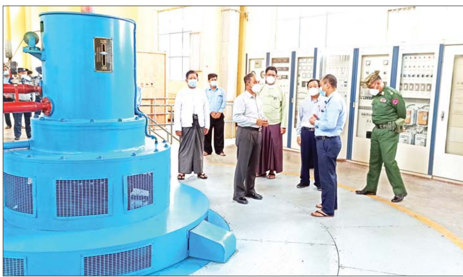
တိုင်းဒေသကြီး ဝန်ကြီးချုပ် ဦးမြတ်ကျော် သဖန်းဆိပ်ရေအားလျှပ်စစ်စက်ရုံသို့ သွားရောက်စစ်ဆေးစဉ်။

ကန့်ဘလူ စက်တင်ဘာ ၆ စစ်ကိုင်းတိုင်းဒေသကြီး ဝန်ကြီးချုပ် ဦးမြတ်ကျော်သည် တိုင်းဒေသကြီး ဝန်ကြီးများနှင့် အတူ ယမန်နေ့က ကျွန်းလှမြို့နယ် သဖန်းဆိပ်ဆည်သို့ သွားရောက်စစ်ဆေးရာ ရှင်းလင်းဆောင်ရွက် ဆောင်ရွက်ခြင်းနှင့် ရေအသုံးချမှုစီမံခန့်ခွဲရေးဦးစီးဌာန တိုင်းဒေသကြီးဦးစီးမှူး ဦးစိုးနိုင်က ဆည်အတွင်း ရေဝင်ရောက်မှု၊ ဆည်ရေသောက် ဧရိယာများတွင် ရေပေးဝေနိုင်မှုနှင့် တရားမဝင် ရွှေမျှောလုပ်ကိုင် နေမှုအခြေအနေများကို ရှင်းလင်းတင်ပြသည်။ လှည့်လည်ကြည့်ရှု ထို့နောက် ဝန်ကြီးချုပ်နှင့်အဖွဲ့သည် သဖန်းဆိပ် ရေအားလျှပ်စစ်စက်ရုံသို့ရောက်ရှိပြီး သဖန်းဆိပ် ရေအားလျှပ်စစ်စက်ရုံမှူးက လျှပ်စစ်ဓာတ်အား ထုတ်လွှတ်မှုအခြေအနေများကို ရှင်းလင်းတင်ပြပြီး သဖန်းဆိပ်ဆည်ကို လှည့်လည်ကြည့်ရှုသည်။ ဆက်လက်၍ ဝန်ကြီးချုပ်နှင့်အဖွဲ့သည် ကျွန်းလှမြို့နယ်စုပေါင်းရုံးအစည်းအဝေးခန်းမ၌ တိုင်းဒေသကြီးအဆင့် ဌာနဆိုင်ရာများ၊ ခရိုင်နှင့် မြို့နယ်အဆင့် ဌာနဆိုင်ရာများ၊ စေတနာ့ဝန်ထမ်းများနှင့် တွေ့ဆုံပြီး မြို့နယ်ကိုဗစ်-၁၉ ကာကွယ်ထိန်းချုပ်ရေးကော်မတီသို့ ငွေကျပ် ၁၀ သိန်းနှင့် အောက်ဆီဂျင်အိုး အလုံး ၂၀၊ အောက်ဆီဂျင်ထုတ်စက် ၁၀ လုံး၊ ကိုဗစ်-၁၉ ကာကွယ်ရေးသုံးပစ္စည်းများ၊ လုံခြုံရေးတပ်ဖွဲ့ဝင်များ