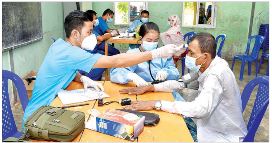
ကိုဗစ်-၁၉ ရောဂါ ကာကွယ်ဆေးထိုးနှံခြင်းမပြုမီ ကျန်းမာရေးစစ်ဆေးပေးစဉ်။