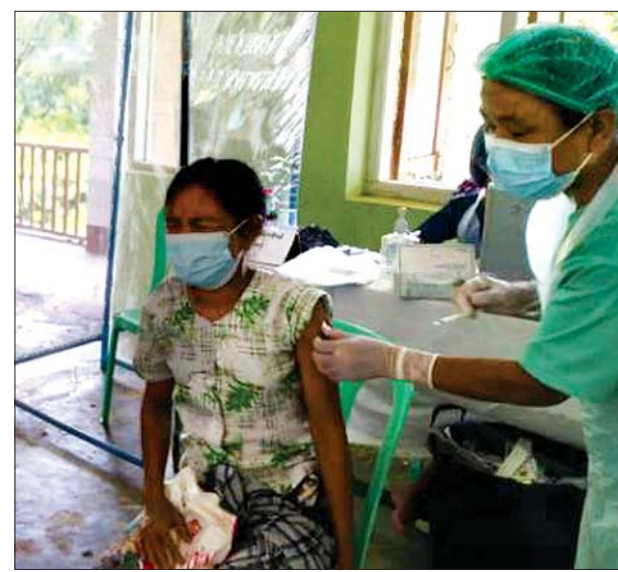
ကိုဗစ်-၁၉ ရောဂါ ကာကွယ်ဆေးထိုးနှံပေးစဉ်။

ယင်းနောက် ကိုဗစ်-၁၉ ရောဂါ ကာကွယ်ဆေး ပထမ အကြိမ် ထိုးနှံရန်အတွက် နေရပ် စွန့်ခွာ ခိုလှုံနေသူများဖြစ်သည့် ပဲခူးစခန်း(၁) နေရပ်စွန့်ခွာ ခိုလှုံ နေသူများ၊မိုးလုံလေလုံအားကစား ခန်းမ နေရပ်စွန့်ခွာ ခိုလှုံနေသူများ၊ ဈေးရပ်ကွက်ဆွေမျိုးများ နေအိမ်၊ ဈေးတောင်ရပ်ကွက် ဆွေမျိုးများ နေအိမ်၊ လေယာဉ်ကွင်းရပ်ကွက်