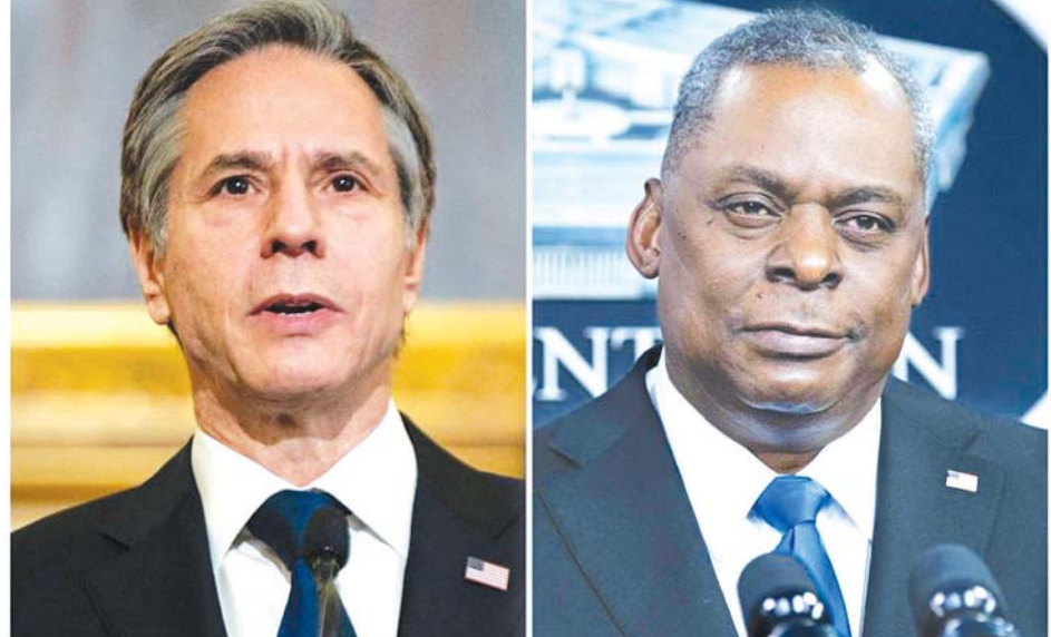
အမေရိကန်နိုင်ငံခြားရေးဝန်ကြီး အန်တိုနီဘလင်ကန်နှင့် ကာကွယ်ရေးဝန်ကြီး လွှဲကင်အော်စတင်။