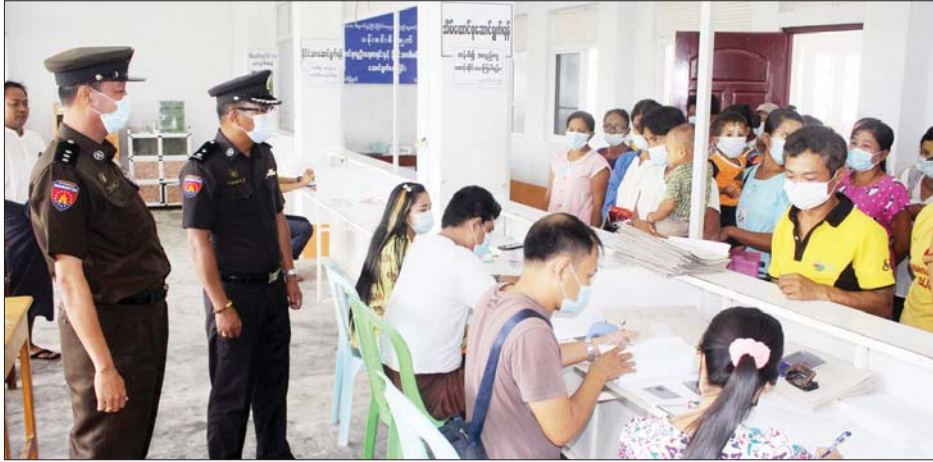
ပန်းခင်းစီမံချက်ဖြင့် ပြည်သူများအား အိမ်ထောင်စုလူဦးရေနှင့် နိုင်ငံသားစိစစ်ရေးကတ်များ ပြုလုပ် ပေးစဉ်။

ပန်းခင်းစီမံချက်သည် နိုင်ငံသားတိုင်း နိုင်ငံသား အခွင့်အရေးမဆုံးရှုံးစေရေး၊ နိုင်ငံသားဂုဏ်သိက္ခာနှင့် အညီ နေထိုင်နိုင်စေရေး ရည်ရွယ်ချက်ဖြင့် မေ ၃ ရက် မှစတင်ကာ အိမ်ထောင်စုစာရင်း မရှိသေးသည့် ပြည်သူများနှင့် အသက် ၁၆ နှစ်နှင့် ၁၈ နှစ်ကြား၊ အသက် ၁၈ နှစ်အထက် နိုင်ငံသားစိစစ်ရေးကတ် မရှိသေးသည့် ပြည်သူများအား ဆောင်ရွက်ပေးလျက် ရှိရာ မြိတ်ခရိုင်အတွင်း ရပ်ကွက်၊ ကျေးရွာအုပ်စု ၁၉ ခုနှင့် တပ်ရင်းတပ်ဖွဲ့များသို့ ကွင်းဆင်း၍ အိမ်ထောင်စု လူဦးရေစာရင်း ၅၅၀၂ စောင်နှင့် နိုင်ငံသားစိစစ်ရေး