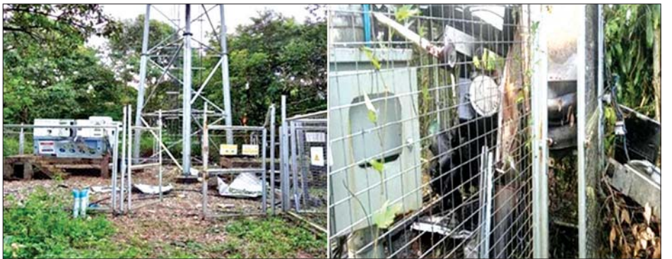
ပြင်ဦးလွင်မြို့နယ် အနီးစခန်းနှင့် ဆင်လမ်းဆည်သို့ ဆက်သွယ်ထားသည့်လမ်းဘေး စိုက်ထူထားသည့် ဆက်သွယ်ရေးတာဝါတိုင်ကို မိုင်းထောင်ဖောက်ခွဲမှုကြောင့် ပျက်စီးခဲ့မှု။