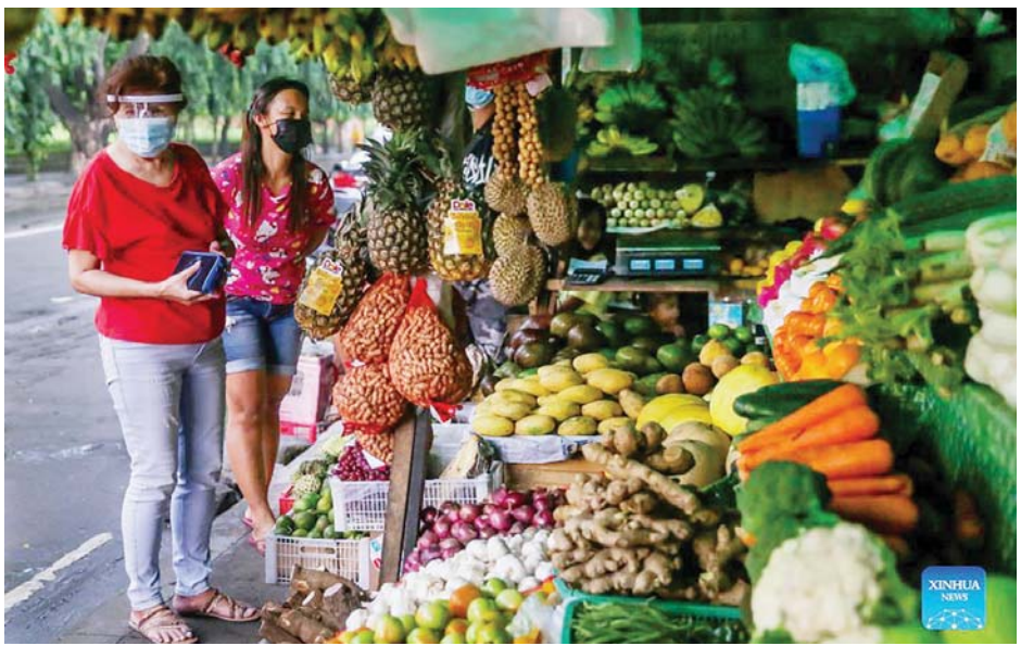
ဖိလစ်ပိုင်နိုင်ငံ ကိုဇန်မြို့ရှိ ဈေးတစ်ခု၌ ပါးစပ်နှာခေါင်းစည်းတပ်ဆင်ထားသော ဈေးဝယ်သူများကို တွေ့ရစဉ်။

ကိုဗစ်-၁၉ ကူးစက်မှုမြင့်နေသည့်တိုင် အစိုးရသည် မြို့တော်မနီလာရှိ ကန့်သတ်ပိတ်ဆို့မှု အဆင့်ကို စက်တင်ဘာ ၈ ရက်မှ ၃ ရက်အထိ လျှော့ချလိုက်သည်။ မြို့တော်မနီလာအနီးဝန်းကျင်တွင် တင်းကျပ်ကြမ်းတမ်းသည့် ကန့်သတ်ပိတ်ဆို့မှုကို အကောင်အထည်ဖော်သွားမည် ဖြစ်ကြောင်းနှင့် ဆွေးနွေးမှုနောက်ဆုံးအဆင့်အထိ ရောက်ရှိနေပြီဖြစ်