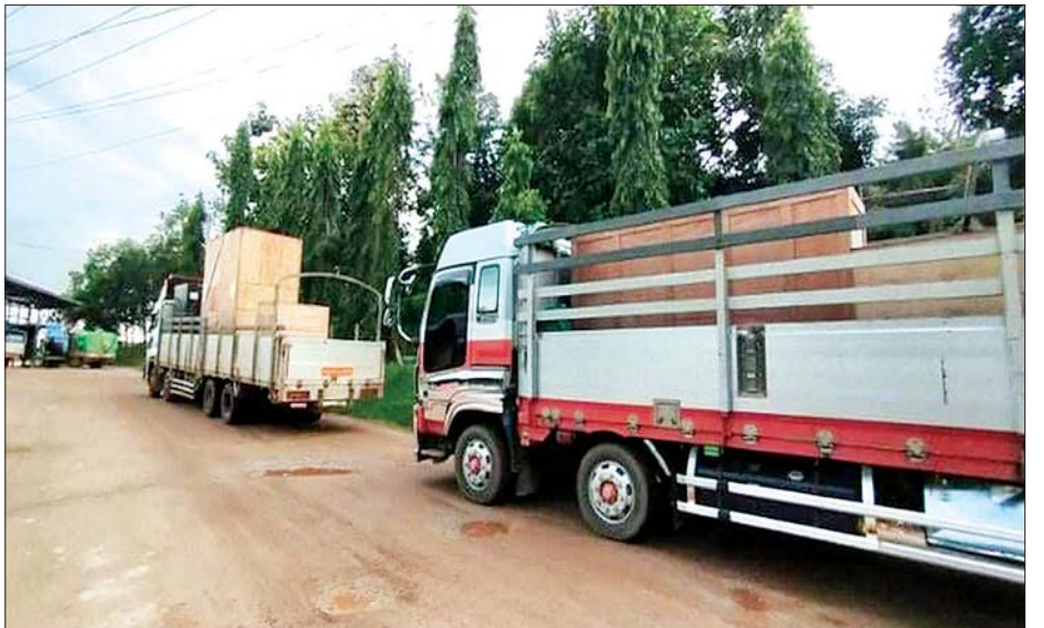
မြဝတီနှင့်ချင်းရွှေဟော် နယ်စပ်ကုန်သွယ်ရေးစခန်းများမှ အောက်ဆီဂျင်အရည်နှင့် ကိုဗစ်-၁၉ ရောဂါ ကာကွယ်၊ ထိန်းချုပ်၊ ကုသရေးဆိုင်ရာ ပစ္စည်းများကို တင်သွင်းလာစဉ်။