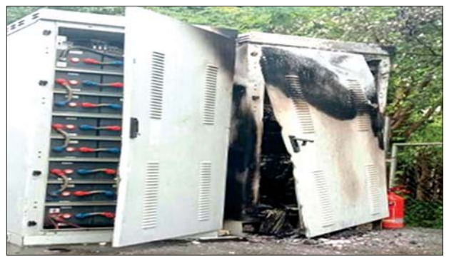
စဉ့်ကူးမြို့နယ် ကျည်တောက်ပေါက်ကျေးရွာ၌ စိုက်ထူထားသည့် Ooredoo ဆက်သွယ်ရေးတာဝါတိုင်၏ အထိုင်စက်ပုံးကို မီးရှို့ခံရသဖြင့် ပျက်စီးမှုကို တွေ့ရစဉ်။