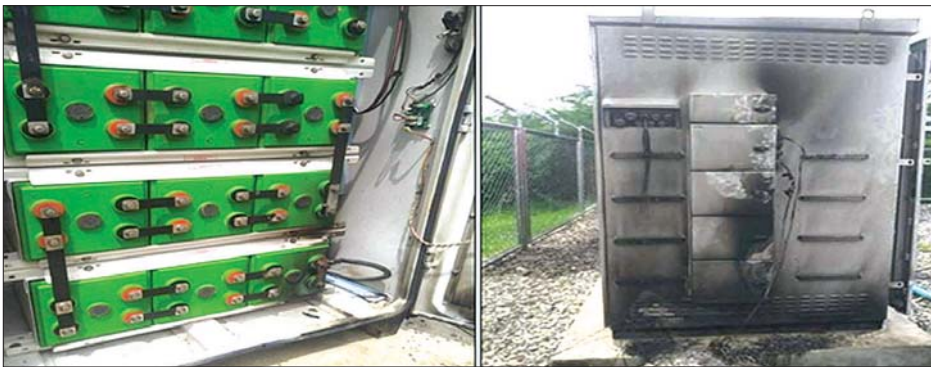
သာစည်မြို့နယ် ကျည်းကန်ကျေးရွာရှိ Mytel/Telenor/Ooredoo ဆက်သွယ်ရေးစက်ခန်းအတွင်းမှ ကေဘယ်လ်ကြိုး၊ ပါဝါကြိုးများ ဖျက်ဆီးခံရမှု။