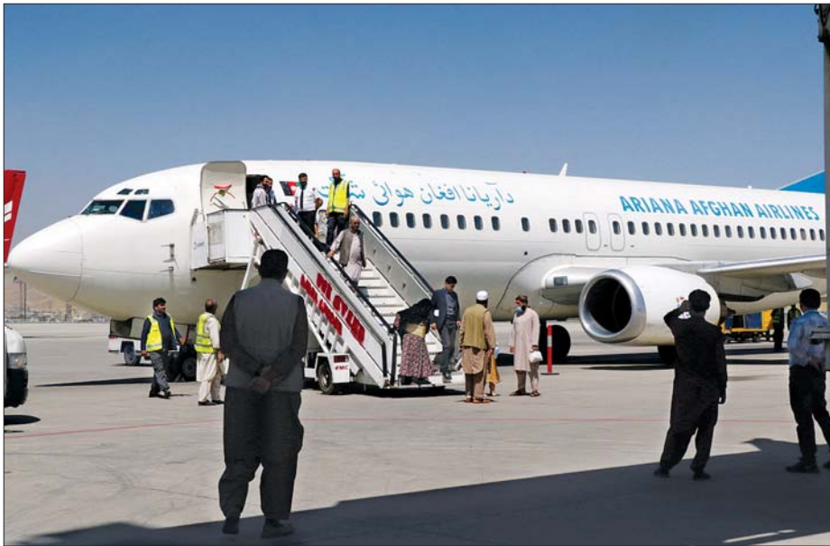
ကဘူးလ်မြို့လေဆိပ်တွင် ခရီးသည်များလေယာဉ်ပေါ်မှဆင်းလာသည်ကို တွေ့ရစဉ်။