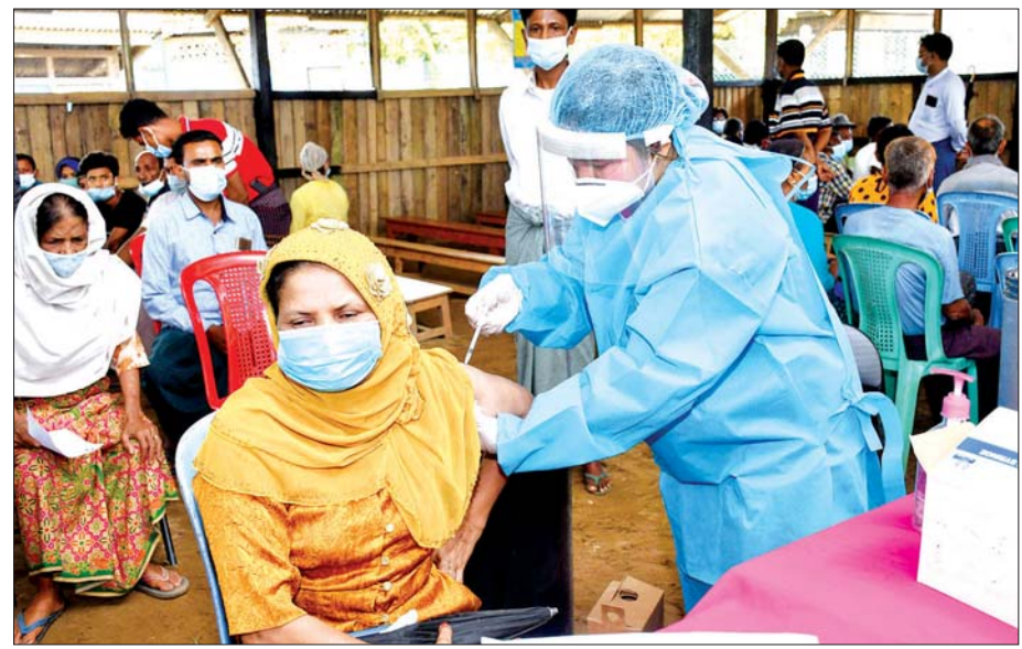
နေရပ်စွန့်ခွာစခန်း(IDPs)များတွင် ခိုလှုံနေသူများအား ကာကွယ်ဆေးထိုးနှံပေးစဉ်။

၆၀၀ အတွက် ထိုးနှံပေးဖို့ စီစဉ်ထားပါတယ်။ ကျေးရွာစာသင်ကျောင်းမှာ လူဦးရေ ၃၀၀ နဲ့ ဘောဇူဖ(၁)စခန်းမှာ လူဦးရေ ၃၀၀ ထိုးနှံပေးဖို့ စီစဉ်ထားပါတယ်။ ဆေးထိုးဖို့လာရောက်တဲ့လူအရေ အတွက်အပေါ်မူတည်ပြီးတော့ ထိုးနှံပေးဖို့စီစဉ်ထား ပါတယ်။ အခုလိုမျိုးပေါ့ ကာကွယ်ဆေးတွေကို ကျွန်တော်တို့ စခန်းတွေ၊ ကျေးရွာတွေအထိ လာပြီး တော့ ထိုးနှံပေးတဲ့ ကျန်းမာရေးဝန်ထမ်းတွေ၊ တပ်မတော်က ဆေးဝန်ထမ်းတွေနဲ့ ကာကွယ်ဆေး ထိုးနှံနိုင်ဖို့ စီစဉ်ပေးတဲ့ နိုင်ငံတော်အစိုးရကို လည်း အထူးကျေးဇူးတင်ရှိကြောင်း ပြောကြားလို ပါတယ်”ဟု ပြောသည်။