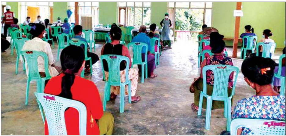
ကိုဗစ်-၁၉ ရောဂါ ကာကွယ်ဆေးထိုးနှံမည့်သူများကို တွေ့ရစဉ်။

ဆွေမျိုးများ နေအိမ်၊ ပျဉ်းတော ဆွေမျိုးများနေအိမ်၌ ဖြင့် လူဦးရေ ၁၁၄၀ ကို ထိုးနှံပေး ပြီး ဖြစ်ကြောင်းနှင့် ဒုတိယအကြိမ် ကိုဗစ်-၁၉ ရောဂါ ကာကွယ်ဆေး Sinopharm အမျိုးအစား ထိုးနှံ ရန် ကျန်ရှိသူ ၁၁၂ ဦးတို့ကို ဆက်လက်ထိုးနှံပေးကြောင်း သိရ သည်။ ဝင်းအိမ်နွယ်(ပြန်/ဆက်)