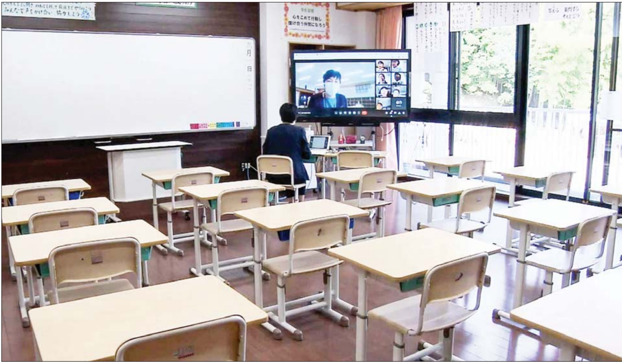
အွန်လိုင်းမှ သင်ကြားနေမှုကို တွေ့ရစဉ်။

ဆရာများနှင့်ဝန်ထမ်းများ ကာကွယ်ဆေးလျှင်မြန်စွာ ထိုးနိုင်ရေးအတွက်လည်း ဒေသခံအာဏာပိုင်များနှင့် တက္ကသိုလ်များကို အကူအညီပေးကြရန် တောင်းဆိုခဲ့ကြသည်။ မည်သည့်အချိန်တွင် ကျောင်းပိတ်ရမည် သို့မဟုတ် ယာယီအားဖြင့် တစ်ကျောင်းလုံးပိတ်ရမည်ဆိုသည့်ဆုံးဖြတ်ချက်ချရန် စံနှုန်းသတ်မှတ်ချက်များကိုလည်း ချမှတ်ပေးထားသည်။ ကျန်းမာရေးဝန်ကြီးဌာနမှ ဖွဲ့စည်းထားသည့်