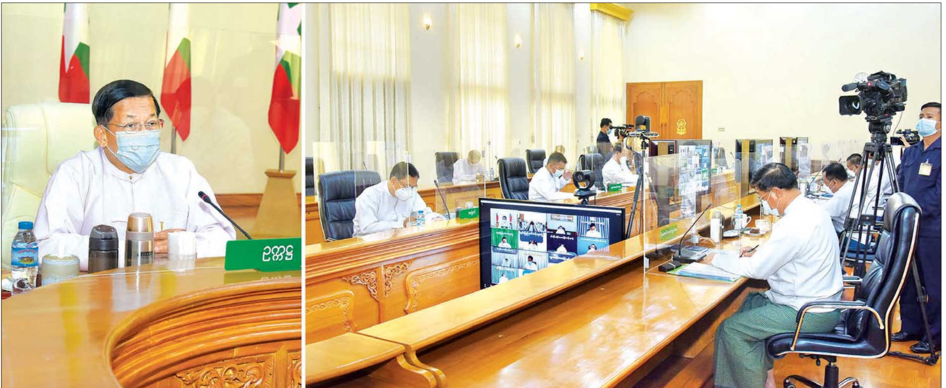
နိုင်ငံတော်စီမံအုပ်ချုပ်ရေးကောင်စီ ဥက္ကဋ္ဌ၊ ပြည်ထောင်စုသမ္မတမြန်မာနိုင်ငံတော် အိမ်စောင့်အစိုးရအဖွဲ့၊ နိုင်ငံတော်ဝန်ကြီးချုပ် ဗိုလ်ချုပ်မှူးကြီး မင်းအောင်လှိုင် ကိုဗစ် - ၁၉ ရောဂါ ကာကွယ်၊ ထိန်းချုပ်၊ ကုသရေးဆိုင်ရာ (၁၁)ကြိမ်မြောက် ညှိနှိုင်းအစည်းအဝေးတွင် အမှာစကားပြောကြားစဉ်။

၄။ တစ်နိုင်ငံလုံး ထာဝရငြိမ်းချမ်းရေးရရှိရေးအတွက် တစ်နိုင်ငံလုံး ပစ်ခတ်တိုက်ခိုက်မှု ရပ်စဲရေးသဘောတူစာချုပ် (NCA) ပါ သဘောတူညီချက်များအတိုင်း ဖြစ်နိုင်သမျှ အလေးထား လုပ်ဆောင်သွားမည်။ ၅။ အရေးပေါ်ကာလဆိုင်ရာ ပြဋ္ဌာန်းချက်များနှင့်အညီ ဆောင်ရွက်ပြီးစီးပါက ဖွဲ့စည်းပုံအခြေခံဥပဒေ (၂၀၀၈ ခုနှစ်) နှင့်အညီ လွတ်လပ်ပြီး တရားမျှတသော ပါတီစုံဒီမိုကရေစီ အထွေထွေရွေးကောက်ပွဲအား ပြန်လည်ကျင်းပ၍ အနိုင်ရသည့်ပါတီအား ဒီမိုကရေစီစံနှုန်းများနှင့်အညီ နိုင်ငံတော်တာဝန်အား လွှဲအပ်နိုင်ရေး ဆက်လက်ဆောင်ရွက်သွားမည်။