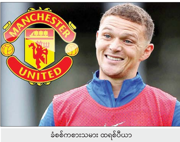
ခံစစ်ကစားသမား ထရစ်ပီယာ

ပရီမီယာလိဂ်ကလပ် မန်ယူအသင်းသည် လာလီဂါကလပ် အက်သလက်တီကို မက်ဒရစ်အသင်းမှ ခံစစ်ကစားသမား ထရစ်ပီယာကို ခေါ်ယူရန် ဆန္ဒရှိနေသေးပြီး လာမည့် ဇန်နဝါရီအပြောင်းအရွှေ့ကာလ တွင် တိုးမြှင့်ကမ်းလှမ်းလုပ်ဆောင်သွားဖွယ်ရှိနေသည်။ မန်ယူအသင်းသည် အဆိုပါ ခံစစ်ကစားသမားအတွက် ယခုနှစ် နွေရာသီအပြောင်းအရွှေ့ကာလတွင် ကနဦးပြောင်းရွှေ့ကြေး ပေါင် ၁၈ သန်းဖြင့် ကမ်းလှမ်းခဲ့သော်လည်း ပယ်ချခံခဲ့ရသည်။ သို့သော်လည်း စပိန်အခြေစိုက် သတင်းရင်းမြစ်များတွင် မန်ယူအသင်းအနေဖြင့် လာမည့်အပြောင်းအရွှေ့ကာလ၌ အင်္ဂလန် ညာခံစစ်ကစားသမား ထရစ်ပီယာကို ခေါ်ယူရန် ပြန်လည်လုပ်ဆောင်လာဖွယ်ရှိကြောင်း ဖော်ပြထားသည်။ အက်သလက်တီကို မက်ဒရစ်အသင်းကလည်း စာမျက်နှာ ၂၅ ကော်လံ ၁ ၀