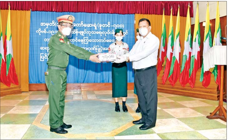
မန္တလေးတိုင်းဒေသကြီးဝန်ကြီးချုပ် ဦးမောင်ကို ဆရာဝန်၊ သူနာပြု၊ ဆေးဝန်ထမ်းများအတွက် အာဟာရဖြည့်စွက်စာအဖြစ် ဂုဏ်ပြုငွေများ ပေးအပ်စဉ်။

များကြောင့် ယခုအခါ ကူးစက်သေဆုံးမှု သိသာစွာ ကျဆင်းလာကြောင်း၊ တပ်မတော်ဆေးရုံ ခုတင် (၇၀၀) မှ ဆရာဝန်၊ သူနာပြု၊ ဆေးဝန်ထမ်းများ အနေဖြင့် အရပ်ဘက်မှ တက်ရောက်ကုသကြသော ကိုဗစ်-၁၉ ရောဂါပိုးတွေ့ရှိ အရပ်ဘက်လူနာများကို ရောဂါကူးစက်ပြီး မိမိအသက်ကို ထိခိုက်အန္တရာယ် ရှိနိုင်သော်လည်း အသက်ပစာနမထားဘဲ ကိုယ်ရောစိတ်ပါ ကုသပေးသည့်အတွက် အထူးကျေးဇူးတင်ရှိကြောင်း ဂုဏ်ပြုစကားပြောကြားသည်။ ဆက်လက်၍ တိုင်းဒေသကြီး ဝန်ကြီးချုပ်က ကိုဗစ်-၁၉ ရောဂါပိုးတွေ့ရှိ အရပ်ဘက်လူနာများကို ကုသစောင့်ရှောက်ပေးခဲ့ကြသည့် ဆရာဝန်၊ သူနာပြု၊ ဆေးဝန်ထမ်းများအတွက် အာဟာရဖြည့်စွက်စာအဖြစ် ဂုဏ်ပြုငွေကျပ် သိန်း ၅၀ ကို ပေးအပ်ရာ အမှတ်(၁) တပ်မတော်ဆေးရုံ ခုတင်(၇၀၀) ဆေးရုံ တပ်မှူး ဗိုလ်မှူးချုပ်မျိုးသန့်က လက်ခံယူပြီး ကျေးဇူးတင်စကား ပြောကြားကြောင်း သတင်းရရှိသည်။ သတင်းစဉ်