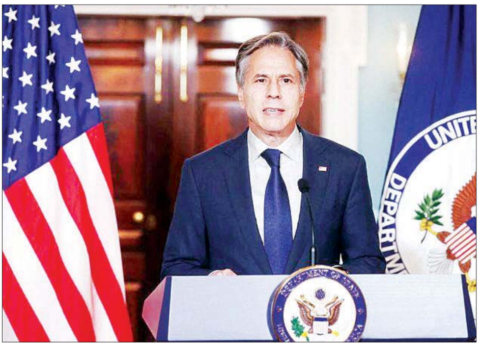
အမေရိကန်နိုင်ငံခြားရေးဝန်ကြီး အန်တိုနီဘလင်ကန်။

တာလီဘန်များသည် ၎င်းတို့၏ ကတိအတိုင်း မည်မျှဆောင်ရွက်နိုင်မည်ကို နိုင်ငံများစွာက စောင့်ကြည့်နေကြကြောင်း ဘလင်ကန်က ပြောသည်။ အာဖဂန်နစ္စတန်မှ အမေရိကန်တပ်များကို ပြန်လည်ခေါ်ယူပြီးနောက် သံတမန်လုပ်ငန်းများကို ကာတာနိုင်ငံ ဒိုဟာမြို့သို့ ရွှေ့ပြောင်းခဲ့သည်။ စက်တင်ဘာ ၅ ရက်တွင်လည်း ကာတာနိုင်ငံ ဒိုဟာမြို့သို့သွားရန် နိုင်ငံခြားရေးဝန်ကြီး ဘလင်ကန်က စီစဉ်ထားသည်။ အမေရိကန် ကာကွယ်ရေးဝန်ကြီးလွှဲကြီးအော်စတင်ကလည်း စက်တင်ဘာ ၅ ရက်မှစတင်ကာ အရှေ့အလယ်ပိုင်း ငါးနိုင်ငံသို့ ခရီးသွားရောက်မည် ဖြစ်ပြီး ကာတာနိုင်ငံသို့ပါ သွားရန်စီစဉ်ထားသည်။ အာဖဂန်နစ္စတန်တွင် အကြမ်းဖက်သမားများ အတွက် နေရာမဖြစ်စေရေးအတွက် ကာတာနိုင်ငံနှင့် သံတမန်ရေးရာနှင့် စစ်ရေးအရ ချည်နှောင်မှုများတိုးမြှင့်သွားရန် အမေရိကန်က ရည်ရွယ်ထားသည်ဟု လေ့လာသူများက ပြောသည်။ အင်န်အိတ်ချ်ကေ