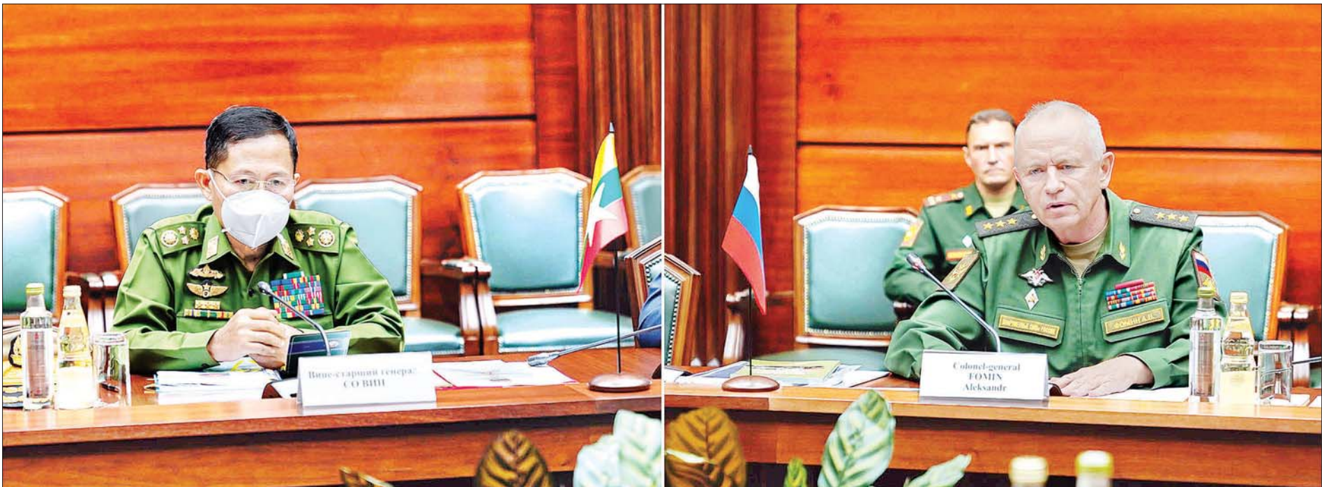
နိုင်ငံတော်စီမံအုပ်ချုပ်ရေးကောင်စီ ဒုတိယဥက္ကဋ္ဌ၊ ဒုတိယတပ်မတော်ကာကွယ်ရေးဦးစီးချုပ် ကာကွယ်ရေးဦးစီးချုပ်(ကြည်း) ဒုတိယဗိုလ်ချုပ်မှူးကြီး စိုးဝင်း ရုရှားဖက်ဒရေးရှင်းနိုင်ငံ၊ ဒုတိယကာကွယ်ရေးဝန်ကြီး Colonel General Alexander Vasilyevich Fomin နှင့် တွေ့ဆုံဆွေးနွေးစဉ်။

သံရုံး၊ စစ်သံရုံး မိသားစုဝင်များအား ရင်းရင်းနှီးနှီးတွေ့ဆုံ