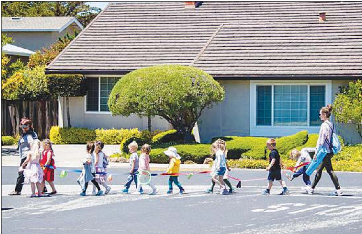
ဆန်ဖရန်စစ္စကိုတွင် ဆရာများနှင့်အတူ အပြင်ထွက်လာသည့်ကလေးများကို ဇွန် ၁၅ ရက်က တွေ့ရစဉ်။

ကူးစက်မှုများ များပြားလာခြင်းကြောင့် အမေရိကန်ဆေးရုံများတွင် ၎င်းတို့ ဝန်ဆောင်မှုပေးနိုင်သည့်ပမာဏအတိုင်း မစွမ်းဆောင်နိုင်ပေ။ ဆေးရုံများတွင် သူနာပြုလိုအပ်ချက် ပြဿနာများလည်း