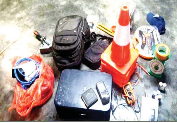
ဒဂုံမြို့သစ်(မြောက်ပိုင်း) အမှတ်(၁၅၀) အိမ်မှ သိမ်းဆည်းရမိသည့် ပစ္စည်းများကို တွေ့ရစဉ်။