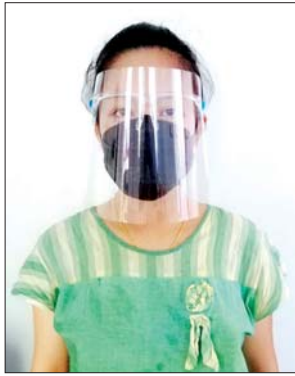
မမြသီတာကျော်