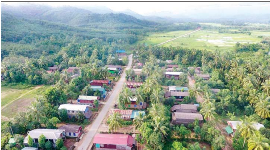
ရေးမြို့နယ် ကဗျာ - တရုတ်ထောက် ကတ္တရာလမ်း ဖောက်လုပ်ပြီးစီးမှုအား တွေ့ရစဉ်။

နေပြည်တော် စက်တင်ဘာ ၄ မွန်ပြည်နယ် ရေးမြို့နယ်အတွင်း ၂၀၁၉ - ၂၀၂၀ ဘဏ္ဍာနှစ်တွင် ဖောက်လုပ်ပြီးစီးခဲ့သော ကဗျာ - တရုတ်ထောက် ပင်လယ်ကမ်းခြေပတ် မြေသားလမ်း ၃ မိုင် ၄ ဖာလုံအနက် ၁ မိုင် ၄ ဖာလုံကို ၂၀၂၀ - ၂၀၂၁ ဘဏ္ဍာနှစ်တွင် ခွင့်ပြုရန်ပုံငွေကျပ် ၂၄၁ ဒသမ ၅၉၉ သန်းဖြင့် ကတ္တရာလမ်းအဖြစ် အဆင့်မြှင့်တင် ဆောင်ရွက်ခဲ့ရာ လုပ်ငန်းများ ရာနှုန်းပြည့် ဆောင်ရွက်ပြီးစီးပြီဖြစ်ကြောင်းနှင့် ကျန်ရှိသည့် မြေသားလမ်း ၂ မိုင်ကိုလည်း ဆက်လက် အဆင့်မြှင့်တင် ဆောင်ရွက်သွားမည်ဖြစ်ကြောင်း နယ်စပ်ဒေသနှင့်တိုင်းရင်းသားလူမျိုးများ ဖွံ့ဖြိုးတိုးတက်ရေးဦးစီးဌာန မွန်ပြည်နယ် ဖွံ့ဖြိုးမှုကြီးကြပ်ရေးရုံးမှ သိရသည်။ အဆိုပါလမ်းသည် ကဗျာကျေးရွာနှင့် တရုတ်ထောက်ကျေးရွာများရှိ အိမ်ထောင်စု ၄၆၅ စု၊ လူဦးရေ ၂၆၂၃ ဦးကို အကျိုးပြုလျက်ရှိကြောင်း သိရှိရသည်။