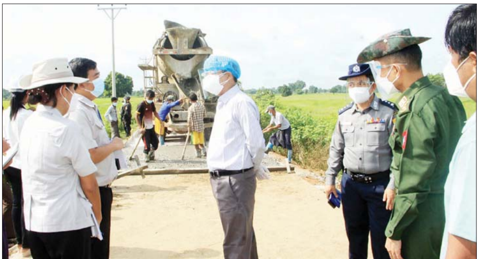
ပဲခူးတိုင်းဒေသကြီးဝန်ကြီးချုပ် ဦးမျိုးဆွေဝင်း တောင်ကြို့ကုန်းလမ်း ကွန်ကရစ်ခင်းနေမှုအား ကြည့်ရှု စစ်ဆေးစဉ်။

ပန်းဆက်သွယ်မှုကောင်းမွန်ရေးသည် အဓိကဖြစ်နေ သဖြင့် သတ်မှတ်စံချိန်စံညွှန်းအတိုင်း ဆောင်ရွက်ကြ ရန် လမ်းညွှန်မှာကြားခဲ့ပြီး စက်ယန္တရားများဖြင့် ကွန်ကရစ်ခင်းခြင်းဆောင်ရွက်မှုအား ကြည့်ရှုသည်။ အဆိုပါတောင်ကြို့ကုန်းလမ်းသည် လက်ပံတန်း မြို့နယ်နှင့် မင်းလှမြို့နယ်အား ဆက်သွယ်ထားသည့် လမ်းဖြစ်ပြီး လက်ပံတန်းမြို့နယ်အပိုင်တွင်(၆/၁.၁၁) မိုင်နှင့် မင်းလှမြို့နယ်အပိုင်တွင်(၇/၇)မိုင်၊ စုစုပေါင်း (၁၄/၀.၁၁)မိုင်ရှည်သော လမ်းဖြစ်သည်။ အဆိုပါ လမ်းကို ၂၀၂၀- ၂၀၂၁ဘဏ္ဍာနှစ်၌ လက်ပံတန်း မြို့နယ်အပိုင်တွင် (၂/၂)မိုင်နှင့် မင်းလှမြို့နယ်အပိုင် တွင် (၀/၅.၈၇၆)မိုင် အရှည် ကွန်ကရစ်ခင်းခြင်း လုပ်ငန်း ဆောင်ရွက်လျက်ရှိသည်။ ဆက်လက်၍ ၂၀၂၁-၂၀၂၂ဘဏ္ဍာနှစ်(mini)ဘတ်ဂျက်တွင် ကျန်ရှိ လမ်းပိုင်းများအား ကျောက်လမ်းခင်းရန် ဆောင်ရွက် လျက်ရှိသည်။ ထို့နောက် တိုင်းဒေသကြီးဝန်ကြီးချုပ်နှင့်အဖွဲ့ သည် ၂၀၂၀-၂၀၂၁ ဘဏ္ဍာနှစ် တိုင်းဒေသကြီး (၄၄လုံး၄၄ရင်း) ရန်ပုံငွေကျပ် ၄၃၃ သန်းဖြင့် ဇီးကုန်း- ကံညီကို- သာပေါင်း -လယ်တွင်းလမ်း (၁/၆.၁)မိုင်ကွန်ကရစ်လမ်းအဖြစ် အဆင့်မြှင့်တင်