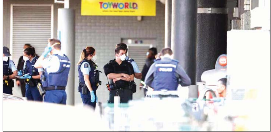
အခင်းဖြစ်ပွားရာနေရာတွင် ရဲများကို တွေ့ရစဉ်။

တူရကီနိုင်ငံ၌ ကိုဗစ်-၁၉ နေ့စဉ်ကူးစက်မှု ၂၂၅၅၇ ဦးရှိ အင်ကာရာ စက်တင်ဘာ ၄ တူရကီနိုင်ငံ၌ စက်တင်ဘာ ၃ ရက်က ကိုဗစ်-၁၉ နောက်ထပ်ကူးစက်ခံရသူ ၂၂၅၅၇ ထပ်မံတွေ့ရှိခဲ့ပြီး စုစုပေါင်းကူးစက်ခံရသူ အရေအတွက်မှာ ၆၄၅၈၆၃၀ ရှိသည်ဟု ကျန်းမာရေးဝန်ကြီးဌာန၏ ပြောကြားချက်အရ သိရသည်။ တူရကီနိုင်ငံ၌ ကိုဗစ်-၁၉ ကြောင့် သေဆုံးသူ ၂၇၆ ဦး တိုးလာရာသေဆုံးသူ စုစုပေါင်းမှာ ၅၇၅၅၉ ဦးရှိသည်။ စက်တင်ဘာ ၂ ရက်တွင် ပြန်လည်ကျန်းမာလာသူဦးရေမှာ ၁၄၅၂၇ ဦးရှိသည်။ တူရကီနိုင်ငံ၌ ဇန်နဝါရီ ၁၄ ရက်မှစတင်ကာ ကိုဗစ်-၁၉ ကာကွယ်ဆေးထိုးနှံမှုစတင်ခဲ့ပြီး တစ်ကြိမ်ကာကွယ်ဆေးထိုးပြီးသူ အရေအတွက်မှာ ၄၉ ဒသမ ၁၉ သန်းရှိပြီး ၃၇ ဒသမ ၉၇ သန်းမှာ နှစ်ကြိမ် ကာကွယ်ဆေးထိုးပြီးဖြစ်သည်။ တူရကီနိုင်ငံတွင် တတိယအကြိမ် ကာကွယ်ဆေးအပါအဝင် ကာကွယ်ဆေးအလုံးရေ ၉၆ ဒသမ ၃၇ သန်း ထိုးနှံပေးပြီးဖြစ်ကြောင်း သိရသည်။ ဆင်ဟွာ