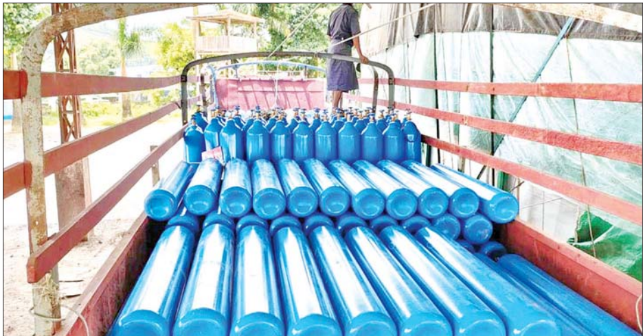
မူဆယ်နယ်စပ်ကုန်သွယ်ရေးစခန်းမှ အောက်ဆီဂျင်အိုးများ သယ်ဆောင်လာသည့် မော်တော်ယာဉ်ကို တွေ့ရစဉ်။

အိမ်သုံးအောက်ဆီဂျင်စက် (Oxygen Concentrator) ၉၃၃၉၅ ခု၊ Test Kit ခုရေ နှစ်သိန်း၊ PPE ဝတ်စုံအစုံရေကိုးသိန်း၊ လက်အိတ် ၁၃၃ တန်နှင့် နှာခေါင်းစည်း (Mask) ၂၀၇၆ တန် တင်သွင်း ခွင့်ပြုခဲ့ပြီးဖြစ်သည်။