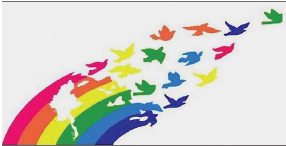
လွဲမှားစွာ သိမြင်နေကြ

သမဝါယမအသင်းများသည် တွေ့မြင်သမျှသော စီးပွားရေးလုပ်ငန်းများကို အထိန်းအကွပ်မဲ့ အမြတ် ရရှိရေးအတွက် ဆောင်ရွက်ခွင့်မရှိပေ။ အသင်းစတင် ဖွဲ့စည်းစဉ်ကပင် ရေးဆွဲအတည်ပြုထားသော “အသင်းစည်းကမ်း” စာအုပ်ပါ စီးပွားရေးလုပ်ငန်း အမျိုးအစားမူဘောင်အတွင်းမှသာ ဆောင်ရွက်ခွင့် ရှိပါသည်။ အသင်းနယ်နိမိတ်မှ အများပြည်သူတို့၏ လူမှု-စီးပွားရေးအကျိုးကို ရှေ့ဆောင်ရွက်ရသော စီးပွားရေး လုပ်ငန်းမျိုးဖြစ်၍ အတည်ပြုပြဋ္ဌာန်း ထားပြီးဖြစ်သည့် “အသင်းစည်းကမ်း” ပါ ကုန် ထုတ်၊ ကုန်သွယ်ဝန်ဆောင်လုပ်ငန်း အမျိုးအစား ကိုသာ ဆောင်ရွက်ရခြင်းဖြစ်သည်။