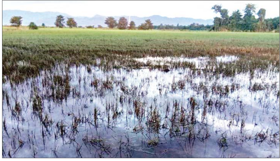
ရေနစ်မြုပ်ပျက်စီးသွားသည့် စိုက်ခင်းများကို တွေ့ရစဉ်။