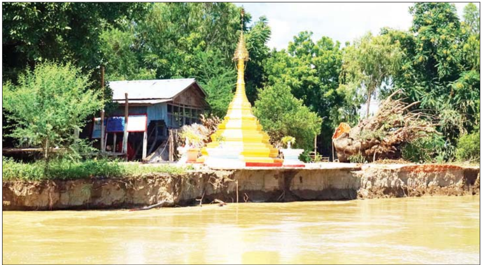
မြစ်ရေတိုက်စားမှုဒဏ်ခံနေရသည့် စေတီတော်ကို တွေ့ရစဉ်။