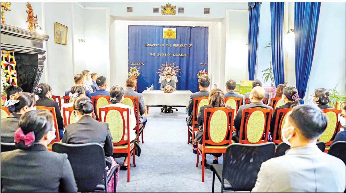
နိုင်ငံတော်စီမံအုပ်ချုပ်ရေးကောင်စီ ဒုတိယဥက္ကဋ္ဌ၊ ဒုတိယတပ်မတော်ကာကွယ်ရေးဦးစီးချုပ် ကာကွယ်ရေးဦးစီးချုပ် (ကြည်း) ဒုတိယဗိုလ်ချုပ်မှူးကြီး စိုးဝင်း မြန်မာသံရုံးနှင့် မြန်မာစစ်သံ (ကြည်း၊ ရေ၊ လေ)ရုံးတို့မှ မိသားစုများအား ရင်းရင်းနှီးနှီးတွေ့ဆုံ အမှာစကားပြောကြားစဉ်။

ထို့ပြင် နိုင်ငံတော်စီမံအုပ်ချုပ်ရေးကောင်စီ ဒုတိယဥက္ကဋ္ဌ၊ ဒုတိယတပ်မတော်ကာကွယ်ရေး ဦးစီးချုပ် ကာကွယ်ရေးဦးစီးချုပ် (ကြည်း) နှင့် အဖွဲ့ဝင်များသည် ရုရှားဖက်ဒရေးရှင်းနိုင်ငံဆိုင်ရာ မြန်မာနိုင်ငံသံရုံးသို့သွားရောက်၍ မြန်မာသံရုံးနှင့်