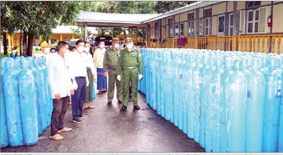
မြိတ်မြို့ပြည်သူ့ဆေးရုံအတွက် ရောက်ရှိလာသော အောက်ဆီဂျင်အိုးများအား တာဝန်ရှိသူများက ကြည့်ရှုစစ်ဆေးစဉ်။

ပေးခြင်းဖြစ်ကြောင်း၊ ယခုကဲ့သို့ လှူဒါန်းမှုမှာ လေးကြိမ်မြောက် ဖြစ်ပြီး ပထမအကြိမ်တွင် မြိတ်မြို့ ပြည်သူ့လူထုအတွက် အောက်ဆီဂျင်အိုး ၃၀၅ လုံး၊ ဒုတိယအကြိမ်တွင် ထားဝယ် မြို့ ပြည်သူ့လူထုအတွက် အောက်ဆီဂျင်အိုး ၄၀၄ လုံး၊ တတိယအကြိမ်တွင် ပြည်သူ့ ဆေးရုံအတွက် အောက်ဆီဂျင်အိုး ၃၅၀ လှူဒါန်းပေးပြီးဖြစ်ကြောင်း သိရသည်။ နိုင်ထူး (မြိတ်)