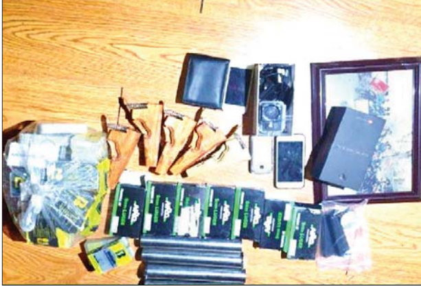
တာမွေမြို့ တိုက် (၇) မှ သိမ်းဆည်းရမိသည့်ပစ္စည်းများကို တွေ့ရစဉ်။

တရားခံများ၏ ထွက်ဆိုချက်များအရ ဖြစ်စဉ်တွင် အသုံးပြုခဲ့သည့် ပစ္စည်းပစ္စာများကို သိုဝှက်သိမ်းဆည်းထားသည့် အောင်ကြီး (တိမ်းရှောင်) နေထိုင်သည့် တိုက်(၄၄)၊ ရန်ကြီးအောင်လမ်း၊ မုန့်လက်ဆောင်းကုန်း(မြောက်)၊ စမ်းချောင်းသို့ သွားရောက်ထပ်မံရှာဖွေခဲ့ရာ