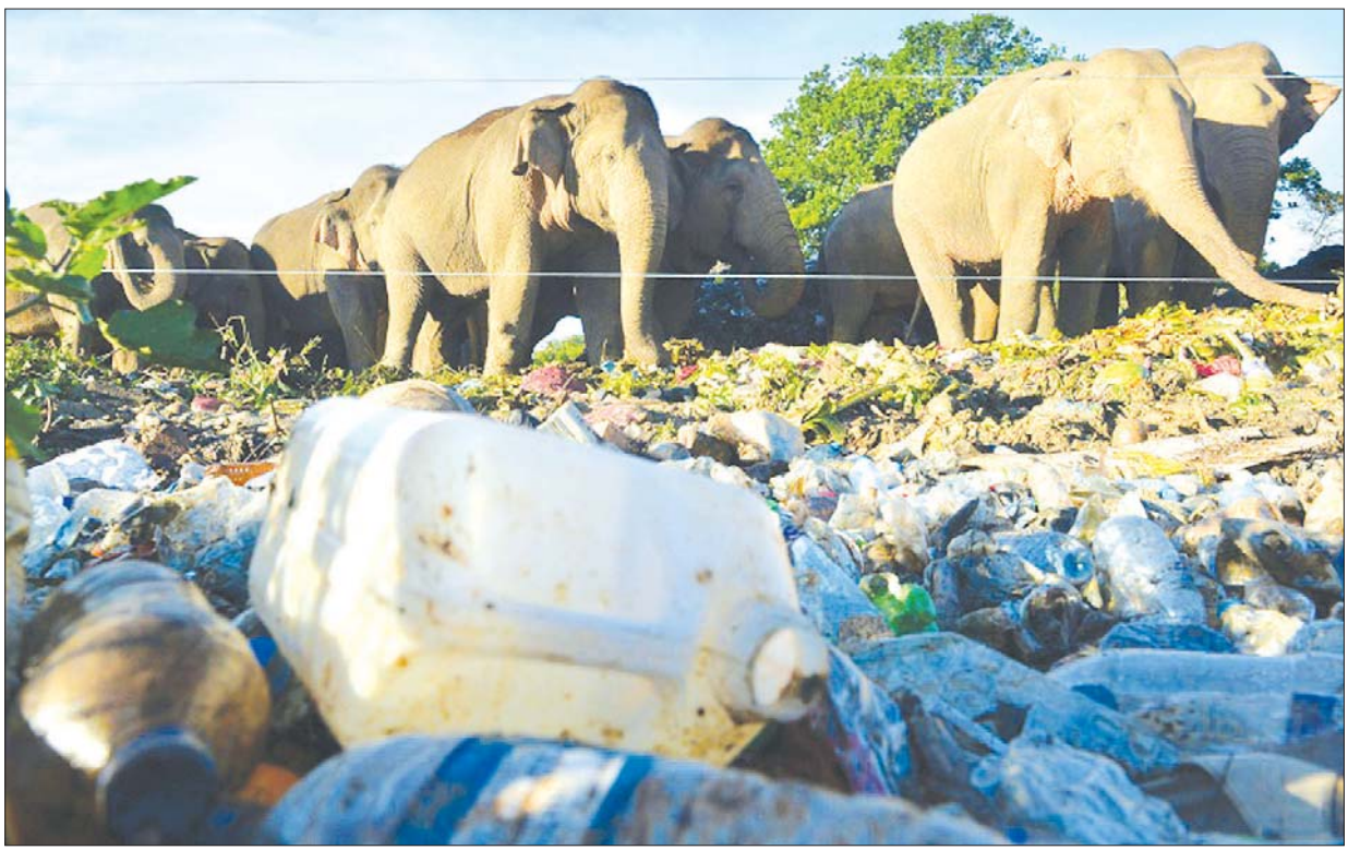
သီရိလင်္ကာတွင် စွန့်ပစ်အမှိုက်ပုံများကြား အစာရှာဖွေစားနေကြသည့် အာရှဆင်များကို တွေ့ရစဉ်။

၂၀၃၀ ပြည့်နှစ်တွင် ပင်လယ်ပြင်တွင် ညစ်ညမ်းပလတ်စတစ် အမှိုက်များစွန့်ပစ်မှုကို အဆုံးသတ်စေရေး တောင်းဆိုခဲ့ကြသည်။ ပလတ်စတစ်ညစ်ညမ်းမှုမှာ တစ်ကမ္ဘာလုံးဆိုင်ရာ ပြဿနာဖြစ်ပြီး