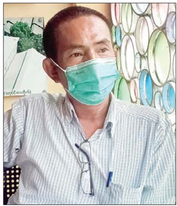
ဦးမြသန်း

ယနေ့ မြန်မာနိုင်ငံအပါအဝင် ကမ္ဘာ့နိုင်ငံအများစုတွင် လတ်တလောရင်ဆိုင်ကြုံတွေ့နေရသော ကိုဗစ်-၁၉ ရောဂါနှင့် ပတ်သက်ပြီး ကျန်းမာရေးဝန်ကြီးဌာနအနေဖြင့် ပြည်သူများအကြား ကူးစက်ပျံ့နှံ့မှု မဖြစ်ပေါ်စေရေး၊ ကာကွယ်ဆေးထိုးနှံပေးမှုများနှင့်အတူ ကျန်းမာရေးစည်းကမ်းချက်များနှင့်အညီ သွားလာနေထိုင်နိုင်ရေး ပညာပေးမှုများ၊ ထုတ်ပြန်ကြေညာမှုများကို အချိန်နှင့်တစ်ပြေးညီ ဆောင်ရွက်ပေးလျက်ရှိသည်။