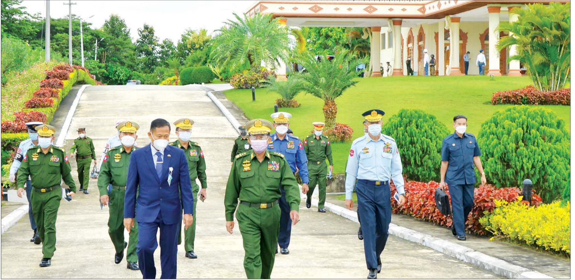
နိုင်ငံတော်စီမံအုပ်ချုပ်ရေးကောင်စီဥက္ကဋ္ဌ၊ တပ်မတော်ကာကွယ်ရေးဦးစီးချုပ် ဗိုလ်ချုပ်မှူးကြီး မင်းအောင်လှိုင် ရုရှားဖက်ဒရေးရှင်းနိုင်ငံတွင် ကျင်းပပြုလုပ်လျက်ရှိသည့် International Army Games-2021 ပိတ်ပွဲအခမ်းအနားသို့ တက်ရောက်မည့် နိုင်ငံတော်စီမံအုပ်ချုပ်ရေးကောင်စီ ဒုတိယဥက္ကဋ္ဌ၊ ဒုတိယတပ်မတော်ကာကွယ်ရေးဦးစီးချုပ် ကာကွယ်ရေးဦးစီးချုပ်(ကြည်း) ဒုတိယဗိုလ်ချုပ်မှူးကြီး စိုးဝင်းနှင့် ကိုယ်စားလှယ်အဖွဲ့အား လေဆိပ်၌ ပို့ဆောင်နှုတ်ဆက်စဉ်။