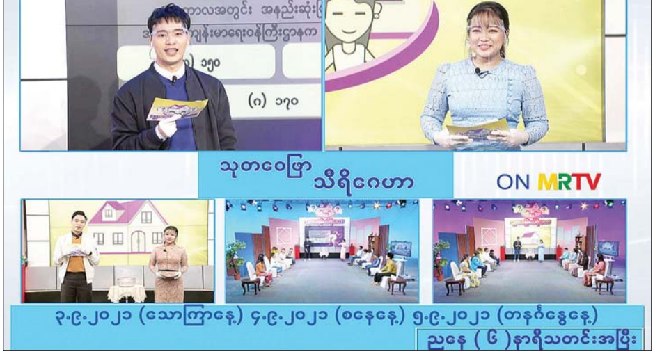
၃-၉-၂၀၂၁ (သောကြာနေ့) ၄-၉-၂၀၂၁ (စနေနေ့) ၅-၉-၂၀၂၁ (တနင်္ဂနွေနေ့) ညနေ (၆) နာရီသတင်းအပြီး

နေပြည်တော် စက်တင်ဘာ ၁၁ - သုတေသနပြုသီရိဂေဟာ မိသားစုပြိုင်ပွဲ အသိပညာပေးအစီအစဉ် (Family Quiz) ပွဲစဉ် (၃၀)ကို စက်တင်ဘာ ၃ ရက် ညနေပိုင်းတွင် မြန်မာ့အသံနှင့် ရုပ်မြင်သံကြားမှ ဆက်လက် ထုတ်လွှင့်မည်ဖြစ်သည်။