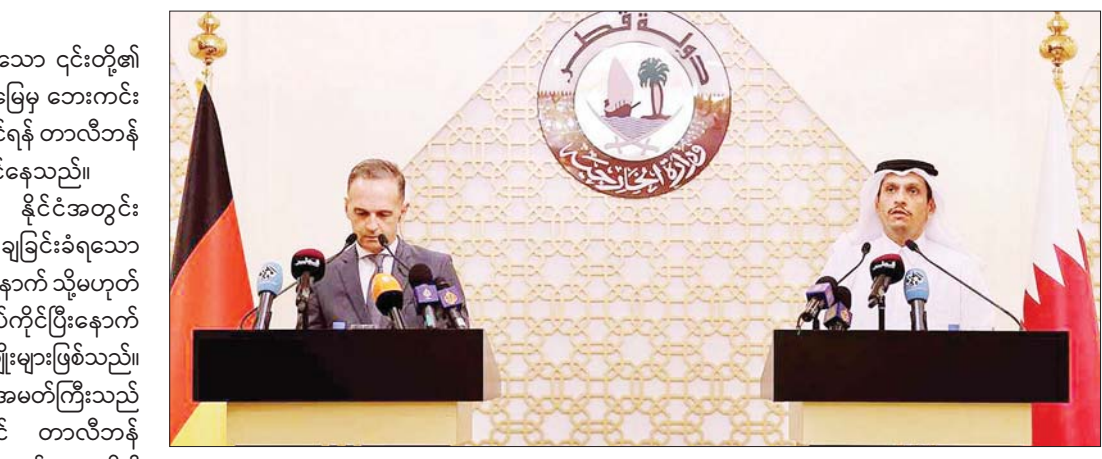
ကာတာနိုင်ငံခြားရေးဝန်ကြီး ရှိတ်မိုဟာမက် ဘင်အဗ္ဗဒူရာမန်အယ်လ်သာနီ (ယာ) ကာတာနိုင်ငံ ဒိုဟာရှိ သတင်းစာရှင်းလင်းပွဲတစ်ခုတွင် ပြောကြားနေစဉ်။

ကာဘူးလ် စက်တင်ဘာ ၁၁ ကာတာနိုင်ငံအနေဖြင့် ကျန်ရှိနေသော ၎င်းတို့၏ နိုင်ငံသားများကို အာဖဂန်နစ္စတန်မြေမှ ဘေးကင်းစွာ ရွှေ့ပြောင်းမှုများ လုပ်ဆောင်နိုင်ရန် တာလီဘန်များနှင့် ဆွေးနွေးမှုများ လုပ်ဆောင်နေသည်။ နိုင်ငံခြားသားများနည်းတူ နိုင်ငံအတွင်း သောင်တင်နေသူများမှာ ဖြုတ်ချခြင်းခံရသော အစိုးရအတွက် အလုပ်လုပ်ပေးပြီးနောက် သို့မဟုတ် နိုင်ငံတကာလုပ်ငန်းများ လုပ်ကိုင်ပြီးနောက် ထွက်လမ်းရှာနေသော အာဖဂန်လူမျိုးများဖြစ်သည်။ ကာတာနိုင်ငံဆိုင်ရာ အိန္ဒိယသံအမတ်ကြီးသည် ဩဂုတ် ၃၁ ရက်က ဒိုဟာတွင် တာလီဘန်ကိုယ်စားလှယ်တစ်ဦးနှင့် တွေ့ဆုံခဲ့သည်။ အဆိုပါ အစည်းအဝေးကို တာလီဘန်တို့၏ တောင်းဆိုမှုဖြင့် စတင်လိုက်သည်။ ၎င်းတို့သည် အာဖဂန်နစ္စတန်နိုင်ငံတွင် သောင်တင်နေသော အိန္ဒိယနိုင်ငံသားများ စေတနာစွာ နေရပ်ပြန်ရေးနှင့် ဘေးကင်းလုံခြုံရေး၊ အိန္ဒိယနိုင်ငံသို့လာရောက်လိုသည့်အာဖဂန်နိုင်ငံသားများ ခရီးသွားလာနိုင်ရေးတို့ကို အဓိကဆွေးနွေးခဲ့သည်။ ဗြိတိန်အစိုးရကလည်း ဩဂုတ် ၃၁ ရက်က ဝန်ကြီးချုပ်၏ အထူးကိုယ်စားလှယ်ကို တာလီဘန်တို့နှင့်တွေ့ဆုံရန် ကာတာသို့စေလွှတ်ခဲ့သည်။