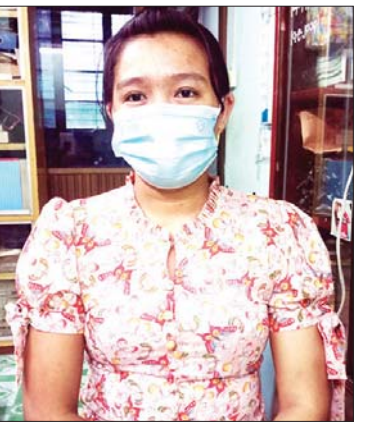
မအိမွန်ကျော်

ပြည်သူများအကြား ကိုဗစ်-၁၉ ကာကွယ်ဆေး ထိုးနှံပေးမှုနှင့် ပတ်သက်၍လည်း တစ်ဆင့်ချင်းစီ သတ်မှတ်ချက်များနှင့်အညီ အလွှာလိုက် တစ်စိုက် မတ်မတ် ထိုးနှံပေးလျက်ရှိရာ အချို့မြို့နယ်များတွင် ဒုတိယအကြိမ် ထိုးနှံပေးခဲ့ပြီးဖြစ်သည်။ ပြည်သူများ အကြား ယင်းသို့ ကိုဗစ်-၁၉ ရောဂါ ကာကွယ်ဆေး ထိုးနှံပေးခြင်း အပါအဝင် ကိုဗစ်-၁၉ ရောဂါနှင့် ပတ်သက်၍ ကြုံတွေ့ဖြတ်ကျော်လာသော ဝန်ထမ်း အများစု၏ ရင်တွင်းစကားသံများကို ရေးသား ဖော်ပြလိုက်ပါသည်။