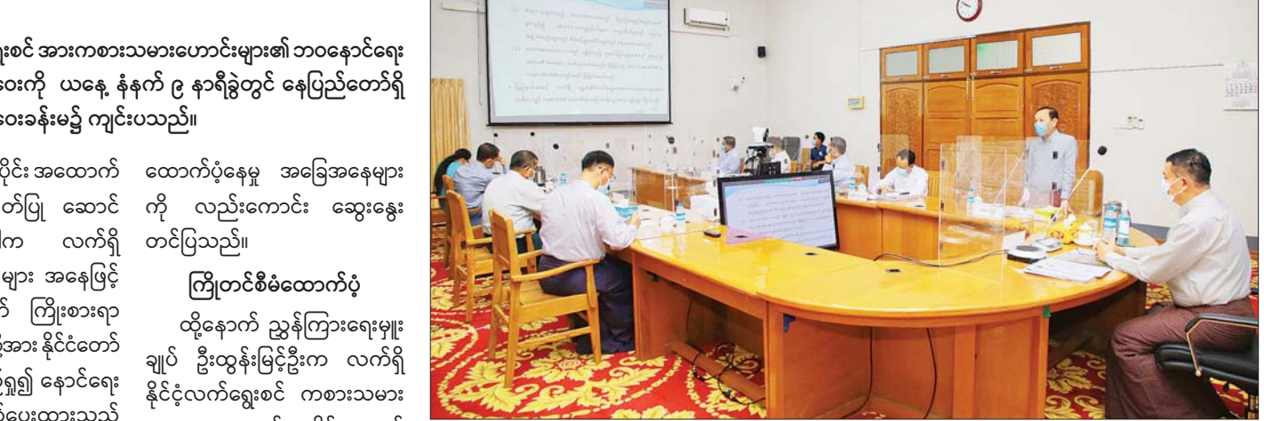
ပြည်ထောင်စုဝန်ကြီး ဦးမင်းသိန်းဇံ နိုင်ငံ့ဂုဏ်မြှင့်တင်ဆောင်ရွက်ခဲ့ကြသည့် မြန်မာ့လက်ရွေးစင် အားကစားသမားဟောင်းများ၏ ဘဝနောင်ရေး အာမခံချက်ရရှိရေး အစီအမံများ ညှိနှိုင်းအစည်းအဝေး တက်ရောက်စဉ်။

နေပြည်တော် စက်တင်ဘာ ၁ နိုင်ငံ့ဂုဏ်မြှင့်တင်ဆောင်ရွက်ခဲ့ကြသည့် မြန်မာ့လက်ရွေးစင် အားကစားသမားဟောင်းများ၏ ဘဝနောင်ရေးအာမခံချက်ရရှိရေး အစီအမံများ ညှိနှိုင်းအစည်းအဝေးကို ယနေ့ နံနက် ၉ နာရီခွဲတွင် နေပြည်တော်ရှိ အားကစားနှင့် လူငယ်ရေးရာဝန်ကြီးဌာန အစည်းအဝေးခန်းမ၌ ကျင်းပသည်။