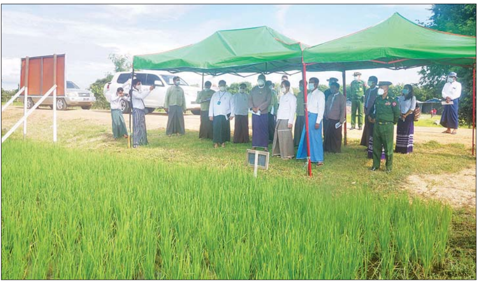
လည်းကောင်းထောက်ပံ့ပေးအပ်ပြီးဆရာစံရပ်ကွက်၊ ဝတ္ထုငွေကျပ် ငါးသောင်းတို့ကို ဆက်ကပ်လှူဒါန်း သည့်။ မဟာဇနကပရိယတ္တိစာသင်တိုက်သို့ သွားရောက်၍ ဝါဆိုသင်္ကန်းနှင့် ဆန် ငါးအိတ်၊ ဆီ ငါးပုံး၊ ဆား ၁၀ ယင်းနောက် နေပြည်တော်ကောင်စီဥက္ကဋ္ဌနှင့် တာဝန်ရှိသူများသည် တပ်ကုန်းမြို့နယ် အထွေထွေ

ထို့နောက် နေပြည်တော်ကောင်စီဥက္ကဋ္ဌနှင့် တာဝန်ရှိသူများသည် တပ်ကုန်းမြို့နယ်အတွင်း ညောင်လွန် ပူးပေါင်းစစ်ဆေးရေးဂိတ်သို့ သွားရောက်ကြည့်ရှု စစ်ဆေးပြီး နှာခေါင်းစည်း ၅၀၀ နှင့် Hand Gel ၁၂ ဘူးကိုလည်းကောင်း၊ တပ်ကုန်းခရိုင် (၁၀၀) ပြည်သူ့ဆေးရုံ၌ ထောက်ပံ့ပေးအပ် ငါးသိန်း၊ Oxygen ဆိုး (40 Liter) ၁၀ လုံး၊ MEDICAL REGULATOR ၁၀ ခု၊ နှာခေါင်းစည်း (Mask) နှင့် Hand Gel တို့ကို