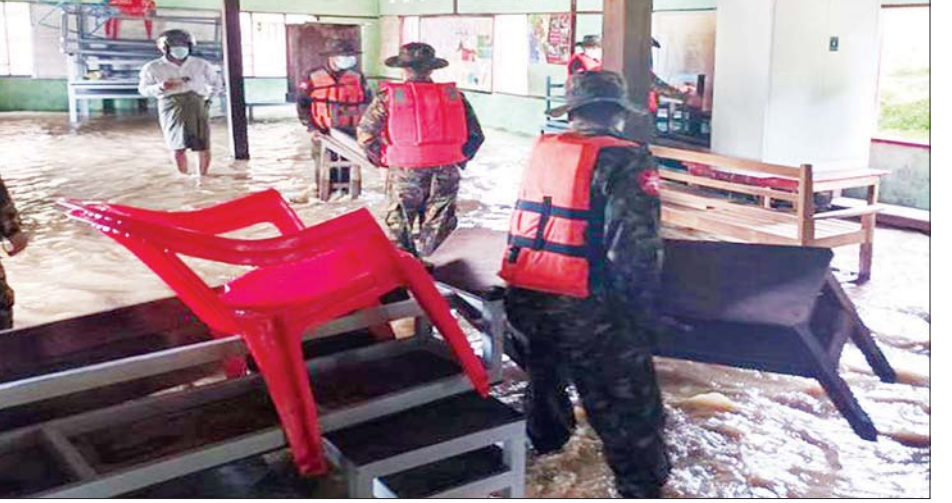
ချောင်းများ ရေလျှံမှုများ

များက ရေဘေးလွတ်ရာသို့ပစ္စည်း များ ရွှေ့ပြောင်းပေးခြင်း၊ အမှိုက် များ ရှင်းလင်းပေးခြင်း၊ မြေဖို့ပေး ခြင်း၊ ယာဉ်လမ်းရှင်းလင်းပေး ခြင်းများနှင့် လိုအပ်သည့် ကူညီ ကယ်ဆယ်ရေး လုပ်ငန်းများ ဆောင်ရွက်ပေးခဲ့ကြောင်း သတင်း စဉ်