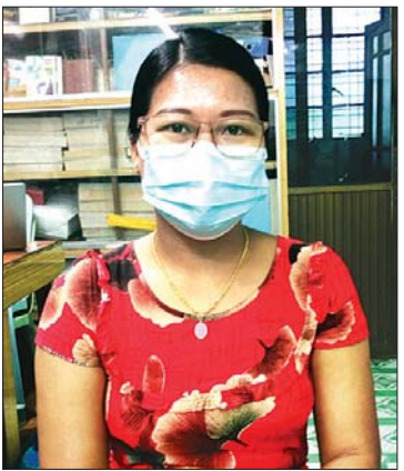
မမေဇင်ဦး