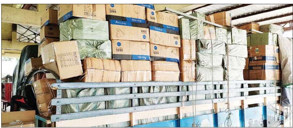
မူဆယ်နယ်စပ်ကုန်သွယ်ရေးစခန်းမှ ကိုဗစ်-၁၉ ကာကွယ်ရေးပစ္စည်းများ သယ်ဆောင်လာသည့် မော်တော်ယာဉ်ကို တွေ့ရစဉ်။

အရည်(Bowser) ယာဉ် နှစ်စီးမှာ ရန်ကုန်မြို့သို့ဖြစ်ကြောင်း သိရသည်။ စီစဉ်ဆောင်ရွက် ကိုဗစ်-၁၉ ရောဂါ ကာကွယ်၊ ထိန်းချုပ်၊ ကုသရေးဆိုင်ရာ ပစ္စည်းများကို သက်ဆိုင်ရာဌာနများနှင့် ညှိနှိုင်းထားသည့် SOP များနှင့်အညီ ဦးစားပေးတင်သွင်းခွင့်ပြုပေးလျက် ရှိပါကြောင်းနှင့် ဆေးဝါးနှင့် ဆက်စပ်ပစ္စည်းများ တင်သွင်းခြင်းနှင့် ဆက်စပ်သည့် အသိပေးကြေညာချက်များကိုလည်း အများပြည်သူ