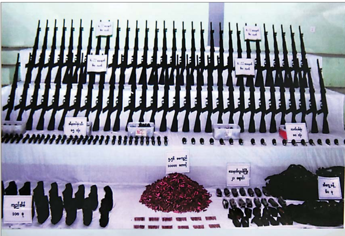
၈-၈-၂၀၂၁ ရက်က မတ္တရာမြို့နယ် ပန်းယုကျေးရွာအနီး ဖမ်းဆီးရမိသည့် လက်နက်/ခဲယမ်းနှင့် ဗုံးသီးများကို တွေ့ရစဉ်။

ပြည်ထဲရေးဝန်ကြီးဌာနမှ ရဲမှူးကြီးကျော်လင်းက NUG | CRPH တို့ဖွဲ့စည်းထားသည့် လက်အောက်ခံအဖွဲ့အစည်းအားလုံးကို အကြမ်းဖက်အုပ်စုအဖြစ် ကြေညာထားပြီးဖြစ်ကြောင်း၊ ထိုကဲ့သို့ ကြေညာသကဲ့သို့ NUG | CRPH၊ PDF တို့အမည်ခံအဖွဲ့အစည်းများကို အကြမ်းဖက်တိုက်ဖျက်ရေးဥပဒေနှင့်လည်း အရေးယူနေခြင်းများ ရှိကြောင်း၊ ထိုသို့အရေးယူသကဲ့သို့ ဥပဒေနှင့်အညီ ၎င်းတို့ကို သက်ဆိုင်ရာ တရားရုံးများတွင် တရားစွဲဆိုပြီးနောက် တရားရုံးမှထုတ်ပြန်သည့် ဖမ်းဝရမ်းများကို နီကြိုပြုလုပ်ပြီး အပြည်ပြည်ဆိုင်ရာ ရဲအဖွဲ့ကိုလည်း ပေးပို့ခြင်းများ ရှိကြောင်း၊ အပြည်ပြည်ဆိုင်ရာ ရဲအဖွဲ့တွင် အဖွဲ့ဝင်နိုင်ငံစုစုပေါင်း ၁၉၄ နိုင်ငံကိုလည်း ဆက်လက်ပေးပို့လျက် ရှိကြောင်း၊ လက်ရှိဆောင်ရွက်နေသည့် များမှာ အဆိုပါအကြမ်းဖက်အဖွဲ့အစည်းများကို နောက်ကွယ်မှ ငွေကြေးများ၊ ပစ္စည်းများ ထောက်ပံ့နေသည့်ကိစ္စများကို သေချာစနစ်တကျစိစစ်ဖော်ထုတ်ပြီး အကြမ်းဖက်မှုတိုက်ဖျက်ရေးဥပဒေဖြင့်