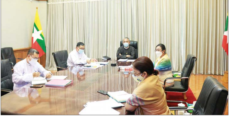
ကိုဗစ်-၁၉ ကြောင့် ဖြစ်ပေါ်လာသည့် စီးပွားရေးသက်ရောက်မှုများအပေါ် ကုစားရေးလုပ်ငန်းကော်မတီက ဦးဆောင်ရေးဆွဲခဲ့သော မြန်မာနိုင်ငံစီးပွားရေး ပြန်လည်ဦးမော့စေရေး စီမံချက်(မူကြမ်း)အပေါ် ပုဂ္ဂလိကကဏ္ဍ၏ အကြံပြုချက်များနှင့် ပတ်သက်၍ တွေ့ဆုံဆွေးနွေးပွဲ ကျင်းပစဉ်။

နေပြည်တော် စက်တင်ဘာ ၁ ကိုဗစ်-၁၉ ကြောင့် ဖြစ်ပေါ်လာသည့် စီးပွားရေးသက်ရောက်မှုများအပေါ် ကုစားရေးလုပ်ငန်းကော်မတီက ဦးဆောင်ရေးဆွဲခဲ့သော မြန်မာနိုင်ငံစီးပွားရေး ပြန်လည်ဦးမော့စေရေး စီမံချက်(မူကြမ်း)အပေါ် ပုဂ္ဂလိကကဏ္ဍ၏ အကြံပြုချက်များနှင့် ပတ်သက်၍ တွေ့ဆုံဆွေးနွေးပွဲကို ယနေ့ မွန်းလွဲပိုင်းတွင် ရင်းနှီးမြှုပ်နှံမှုနှင့် နိုင်ငံခြားစီးပွားဆက်သွယ်ရေး ဝန်ကြီးဌာန၌ Virtual စနစ်ဖြင့် ကျင်းပသည်။ အစည်းအဝေးသို့ ကိုဗစ်-၁၉ ကြောင့် ဖြစ်ပေါ်လာသည့် စီးပွားရေး သက်ရောက်မှုများအပေါ် ကုစားရေး လုပ်ငန်းကော်မတီ ဥက္ကဋ္ဌ၊ ရင်းနှီးမြှုပ်နှံမှုနှင့် နိုင်ငံခြားစီးပွား ဆက်သွယ်ရေး ဝန်ကြီးဌာန ပြည်ထောင်စုဝန်ကြီး ဦးအောင်နိုင်ဦး၊ ရင်းနှီးမြှုပ်နှံမှုနှင့် နိုင်ငံခြားစီးပွားဆက်သွယ်ရေး ဝန်ကြီးဌာန ဒုတိယဝန်ကြီး ဦးသန်းအောင်ကျော်၊ လုပ်ငန်းကော်မတီ အတွင်းရေးမှူး၊ ရင်းနှီးမြှုပ်နှံမှုနှင့် နိုင်ငံခြားစီးပွားဆက်သွယ်ရေး ဝန်ကြီးဌာန ညွှန်ကြားရေးမှူးချုပ် ဒေါက်တာ ဝါဝါမောင်နှင့် ပြည်ထောင်စုသမ္မတ မြန်မာနိုင်ငံ ကုန်သည်များနှင့် စက်မှုလက်မှု လုပ်ငန်းရှင်များ အသင်းချုပ်မှ တက်ရောက်ကြသည်။ အစည်းအဝေးတွင် မြန်မာနိုင်ငံ စီးပွားရေး ပြန်လည်ဦးမော့စေရေးစီမံချက် (မူကြမ်း) အပေါ် ပုဂ္ဂလိကကဏ္ဍ၏ အကြံပြုချက်များအား စီမံချက်အဆိုပြုလွှာများနှင့်တကွ ဆွေးနွေးကြပြီး ဆွေးနွေးချက်များနှင့် ပတ်သက်၍ စီမံချက်တွင် လိုအပ်သလို ပြည့်သွင်းနိုင်ရေးနှင့် စီမံချက်အား အကောင်အထည်ဖော်ရာတွင် ပုဂ္ဂလိကကဏ္ဍ ထိရောက်စွာ ပါဝင်ဆောင်ရွက်နိုင်မည့် နည်းလမ်းများကို ညှိနှိုင်းခဲ့ကြသည်။ သတင်းစဉ်