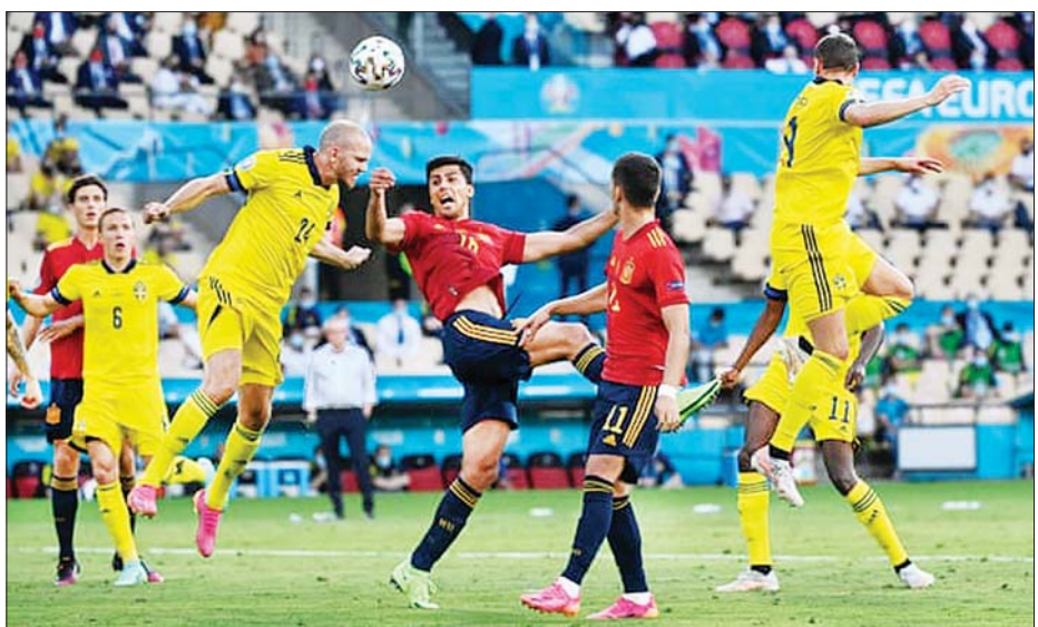
ဆွီဒင်အသင်းနှင့် စပိန်အသင်းတို့ ယူရို ၂၀၂၀ ပြိုင်ပွဲ၌ ယှဉ်ပြိုင်ကစားစဉ်။

ဆွီဒင်အသင်းနှင့် စပိန် အသင်းတို့ နောက်ဆုံးထိပ်တိုက်