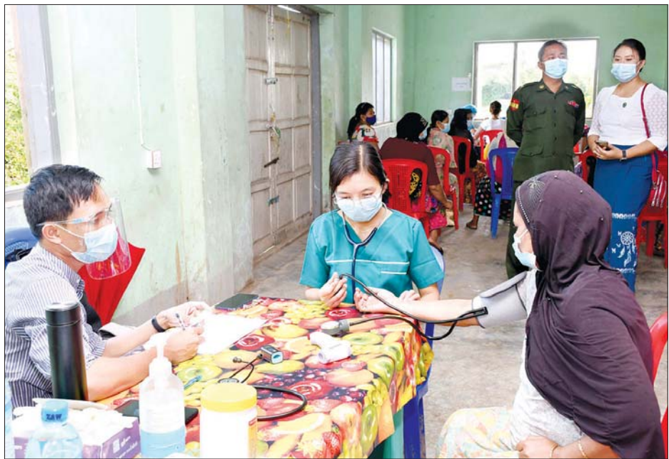
သဲချောင်းနေရပ်စွန့်ခွာစခန်းမှ အမျိုးသမီးတစ်ဦးအား သွေးပေါင်ချိန်တိုင်းပေးစဉ်။