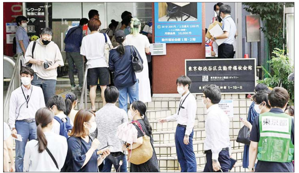
တိုကျိုရှိ ရှိတူရာရပ်ကွက်တွင် ပြည်သူများ ကိုဗစ်-၁၉ ကာကွယ်ဆေးထိုးရန် လက်မှတ်များ တန်းစီ ရယူနေသည်ကို တွေ့ရစဉ်။

၅၀၀၀၀၀ ကျော်လွန်ရန် ၁၅ လ ကြာမြင့်ခဲ့သည်။ သို့သော်လည်း ကိုဗစ်-၁၉ ကူးစက်သူ တစ်သန်းကျော်ရှိရန် လေးလသာ ကြာမြင့်ခဲ့သည်။ အဆိုဆုံးမှာ နိုင်ငံအတွင်း ကိုဗစ်-၁၉ ကူးစက်သူပေါင်း ၁ ဒသမ ၅ သန်းအထိ ရောက်ရှိရန် ၂၆ ရက်သာ ကြာမြင့်ခဲ့သည်။ နိုင်ငံတစ်ဝန်း နေ့စဉ် ကိုဗစ်-၁၉ ကူးစက်သူပေါင်း ၂၀၀၀၀ နီးပါးရောက်ရှိလာခဲ့ပြီး အပြင်းအထန် ဖျားနာသူပေါင်းမှာ လည်း စံချိန်တင်မြင့်တက်လျက်ရှိသည်။ ထို့အတူ နေအိမ်တွင်း သီးသန့် ကန့်သတ်စောင့်ကြည့်သူ အရေအတွက်လည်း မြင့်တက်လာခဲ့ပြီး ဩဂုတ် ၂၅ ရက်က ၁၁၈၀၀၀ အထိ ရောက်ရှိလာခဲ့သည်။ တိုကျို အနီးဝန်းကျင် တစ်ဝိုက်ရှိ ကျန်းမာရေးစောင့်ရှောက်မှုစနစ်များမှာလည်း ဝန်ပိုလျက်ရှိကြောင်း သိရပြီး