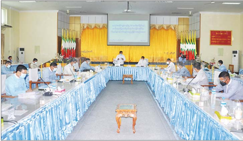
ပြည်ထောင်စုဝန်ကြီး ဒေါက်တာချာလီသန်း အလုပ်အကိုင်ကျွမ်းကျင်မှု 'စံ' သတ်မှတ်ခြင်းနှင့် အသိအမှတ်ပြုလက်မှတ် ထုတ်ပေးခြင်းဆိုင်ရာ ကိစ္စရပ်များနှင့်စပ်လျဉ်းသည့် ညှိနှိုင်းအစည်းအဝေးတွင် အမှာစကား ပြောကြားစဉ်။

နေပြည်တော် စက်တင်ဘာ ၁ အလုပ်အကိုင်ကျွမ်းကျင်မှု 'စံ' သတ်မှတ်ခြင်းနှင့် အသိအမှတ်ပြုလက်မှတ် ထုတ်ပေးခြင်းဆိုင်ရာ ကိစ္စရပ်များနှင့် စပ်လျဉ်းသည့် ညှိနှိုင်းအစည်းအဝေးကို ယနေ့ မွန်းလွဲပိုင်းတွင် စက်မှုဝန်ကြီးဌာန၌ ကျင်းပသည်။