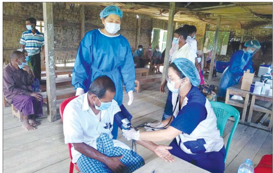
နေရပ်စွန့်ခွာစခန်းတစ်ခု၌ ပြည်သူတစ်ဦးအား ကာကွယ်ဆေးထိုးပေးနေစဉ်။

ပေါက်တော စက်တင်ဘာ ၁ ရခိုင်ပြည်နယ်ပေါက်တောမြို့နယ် ပုဏ္ဏားကြီးကျေးရွာအုပ်စု ငှက်ချောင်း နေရပ်စွန့်ခွာစခန်း (IDPs) နှစ်ခုတွင် ခိုလှုံနေကြသော ပြည်သူ တော မြို့နယ် ပြည်သူ့ကျန်းမာရေး ဦးစီးဌာနက ထိုးနှံပေး