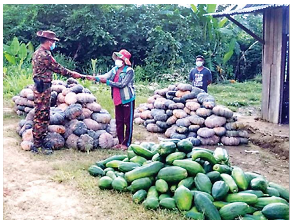
ထားဝယ်မြို့နယ် ထီးခီးဒေသဘက်မှ အသီးအနှံများကို ကမ်းရိုးတန်းဒေသတိုင်းစစ်ဌာနချုပ် နယ်မြေခံ တပ်မတော်သားများက ဒေသခံတောင်သူများထံမှ ဝယ်ယူနေစဉ်။

နှင့် ကုန်ထုတ်လုပ်မှုလုပ်ငန်းများ ရာနှုန်းပြည့် ဆောင်ရွက်နိုင်ရေး လိုအပ်သည်များ ပေါင်းစပ်ညှိနှိုင်း ဆောင်ရွက် ပေးခဲ့သည်။ ထို့ပြင် ကိုဗစ်-၁၉ ရောဂါ ဖြစ်ပွားမှုကြောင့် လမ်းပန်း ဆက်သွယ်ရေး ခက်ခဲမှုများ ဖြစ်ပေါ်ခဲ့ပြီး ဈေးကွက်အတွင်း ရောင်းချရန်အခက်အခဲဖြစ်ပေါ် လျက်ရှိသည့် ဒေသခံတိုင်းရင်း သားပြည်သူများ၏ စိုက်ခင်းများမှ သီးနှံများကို နယ်မြေခံတပ်မတော် သားများက ဒေသပေါက်ဈေး အတိုင်း ဝယ်ယူပေးလျက်ရှိရာ ယနေ့တွင် တနင်္သာရီတိုင်းဒေသ ကြီး ထားဝယ်မြို့နယ် ထီးခီး ဒေသဘက်မှ ဒေသခံတောင်သူ များ၏ စိုက်ခင်းများမှ သီးနှံများကို ကမ်းရိုးတန်းဒေသတိုင်းစစ်ဌာန ချုပ် နယ်မြေခံတပ်မတော်သား များက ဒေသပေါက်ဈေးအတိုင်း သွားရောက် ဝယ်ယူပေးခဲ့ပြီး အဆိုပါဝယ်ယူခဲ့သည့် သီးနှံ များကို ကိုဗစ်-၁၉ ရောဂါကုသရေး စင်တာများသို့ ဖြန့်ဝေလှူဒါန်း သွားမည်ဖြစ်ကြောင်း သတင်း ရရှိသည်။ သတင်းစဉ်