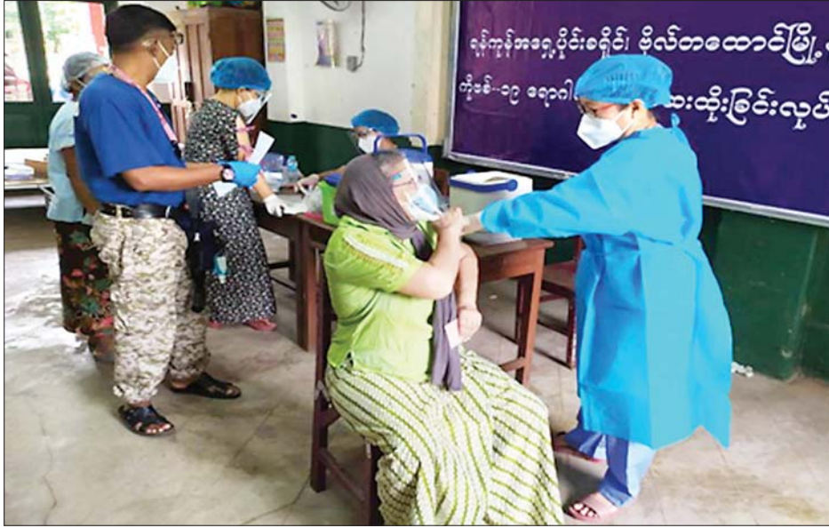
ရန်ကုန်တိုင်းဒေသကြီး ဗိုလ်တထောင်မြို့နယ်၌ ကိုဗစ်-၁၉ ရောဂါ ကာကွယ်ဆေး ထိုးနှံပေးစဉ်။

နေပြည်တော် ဩဂုတ် ၁၈ တိုင်းဒေသကြီးနှင့် ပြည်နယ်အသီးသီးရှိ ထေရ်ကြီး ဝါကြီး ဆရာတော်ကြီးများ အပါအဝင် လူမျိုးမရွေး၊ ဘာသာမရွေး အသက်(၆၅)နှစ်နှင့်အထက် သက်ကြီး ဘိုးဘွားများ၊ ဌာနဆိုင်ရာဝန်ထမ်းများ၊ တိုင်းရင်းသား ပြည်သူများနှင့် အကျဉ်းထောင်များ၌ ပြစ်ဒဏ်ကျခံ နေသည့် အကျဉ်းသား၊ အကျဉ်းသူများအား ကိုဗစ်- ၁၉ ရောဂါ ကာကွယ်ဆေးထိုးနှံနိုင်ရေးအတွက် ဆေးနှင့်ဆေးပစ္စည်းများကို တပ်မတော် လေယာဉ် များဖြင့် သယ်ယူပို့ဆောင်ပေးခြင်းများနှင့် ကာကွယ် ဆေးထိုးနှံပေးခြင်းများကို ဝိုင်းဝန်းကြိုးပမ်း ဆောင်ရွက်လျက်ရှိသည်။