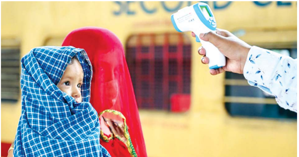
အိန္ဒိယနိုင်ငံ မွမ်ဘိုင်ရှိ ဘူတာရုံတွင် ကလေးငယ်တစ်ဦးကို သက်ဆိုင်သူတစ်ဦးက အပူချိန်တိုင်းတာစစ်ဆေးနေသည်ကို တွေ့ရစဉ်။

လူပေါင်း ၁၂၁ သန်းကျော် လူဦးရေ၏ ၈ ဒသမ ၉ ရာခိုင်နှုန်းကျော် ကိုဗစ်-၁၉ ကာကွယ်ဆေး အပြည့်အဝ ထိုးနှံပြီးပြီဖြစ်ပါတယ်။ လူပေါင်း ၄၂၂ သန်းကျော်၊ လူဦးရေ၏ ၃၀ ဒသမ ၉ ရာခိုင်နှုန်းကျော်