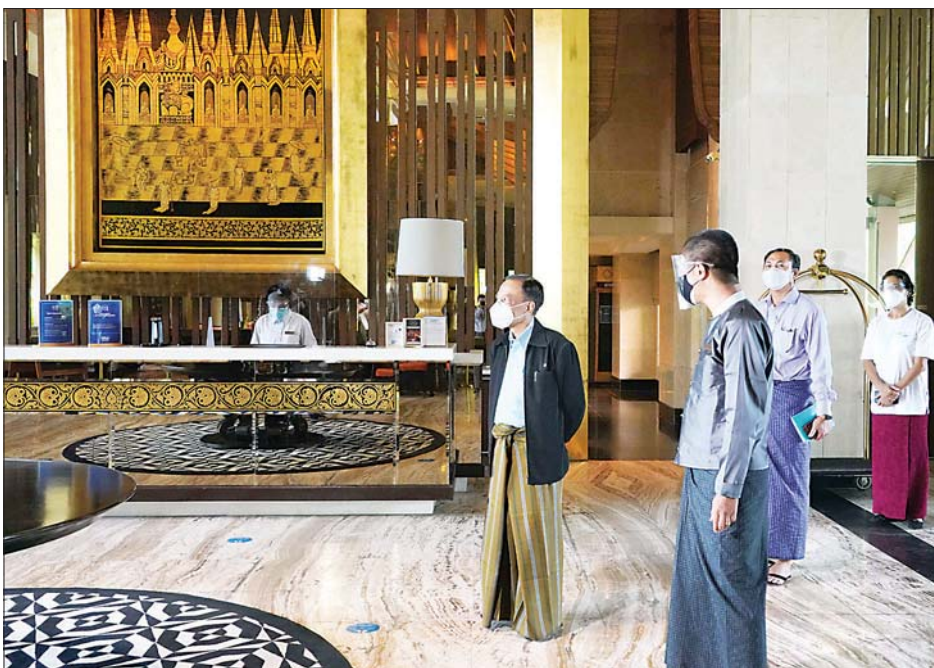
ဧည့်ဂေဟာဟိုတယ်တည်ဆောက်ရေးအဖွဲ့ဝင်များနှင့် ဌာနဝန်ထမ်းများက နေပြည်တော်ကောင်စီနယ်မြေ ဒက္ခိဏသီရိမြို့နယ်ရှိ နိုင်ငံတော်ဧည့်ဂေဟာ ဟိုတယ်များကို ကြည့်ရှုနေကြသည်။

ဟိုတယ်နှင့်ခရီးသွားလာရေးဝန်ကြီးဌာန ပြည်ထောင်စုဝန်ကြီး ဒေါက်တာဌေးအောင်သည် ယနေ့ မွန်းလွဲပိုင်းတွင် ကျန်းမာရေးဝန်ကြီးဌာနမှ ထုတ်ပြန်ထားရှိသည့် ကိုဗစ်-၁၉ ကာကွယ်၊ ထိန်းချုပ်ရေးဆိုင်ရာ စည်းမျဉ်းစည်းကမ်းများနှင့်အညီ ဖွင့်လှစ်ဆောင်ရွက်လျက်ရှိသည့် နေပြည်တော်ကောင်စီနယ်မြေ ဒက္ခိဏသီရိမြို့နယ်ရှိ နိုင်ငံတော်ဧည့်ဂေဟာ ဟိုတယ်များကို ကြည့်ရှုသည်။ (ယာပုံ)