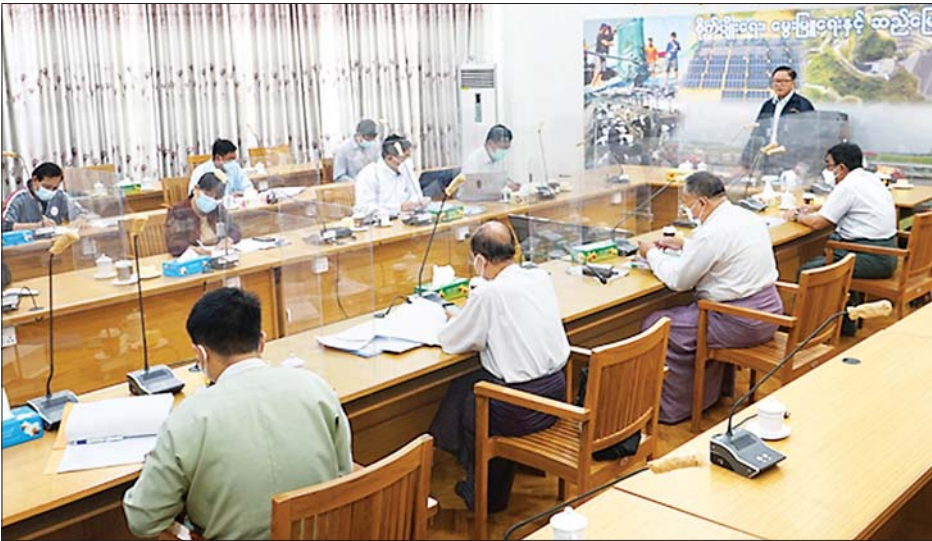
ဒေသဆိုင်ရာ သုတေသနစခန်းများ ရှိနေကြသော်လည်း သားငါးကဏ္ဍကြီး တစ်ခုလုံးအတွက် အားကောင်းသော သုတေသနလုပ်ငန်းများ ဆောင်ရွက်နိုင်ရန်၊ သုတေသန လုပ်ငန်းအတွက် သီးခြားဘဏ္ဍာရန်ပုံငွေ သတ်မှတ်ပြီး ထိရောက်သော နည်းပညာရပ်ဆိုင်ရာ သုတေသနနှင့် လက်တွေ့အသုံးချသုတေသနများ ဖော်ထုတ်ဆောင်ရွက်နိုင်ရန်၊ သုတေသနဦးစီးဌာနနှင့် မွေးမြူရေးဆိုင်ရာ ဆေးတက္ကသိုလ်တို့ အပြန်အလှန် ချိတ်ဆက်ပူးပေါင်း ဆောင်ရွက်နိုင်ခြင်းဖြင့် အရည်အသွေး ပိုမိုမြင့်မားသည့် မွေးမြူရေးဆိုင်ရာ ရန်တို့ကို ရည်ရွယ်၍ နိုင်ငံတော်စီမံအုပ်ချုပ်ရေး ကောင်စီ၏ လမ်းညွှန်ချက်နှင့်အညီ မွေးမြူရေးဆိုင်ရာ သုတေသနဦးစီးဌာနကို ဦးစီးဌာနသစ်တစ်ခုအဖြစ် ဖွဲ့စည်းဆောင်ရွက်သွားမည်ဖြစ်ကြောင်း၊ အလားတူ ချင်းပြည်နယ်၏ စီးပွားရေးနှင့် လူမှုရေးနယ်ပယ်တွင် အရေးပါပြီး ဒေသရေမြေရာသီဥတုအရ စီးပွားဖြစ်မွေးမြူ

မွေးမြူရေးဆိုင်ရာ သုတေသန ဦးစီးဌာန ဖွဲ့စည်းဆောင်ရွက်နိုင်ရေးနှင့် ချင်းပြည်နယ်၏ နွားနောက်မွေးမြူမှုလုပ်ငန်း ပိုမိုဖွံ့ဖြိုးလာရေး လုပ်ငန်းညှိနှိုင်းအစည်းအဝေးကို ယနေ့မွန်းလွဲပိုင်းက စိုက်ပျိုးရေး၊ မွေးမြူရေးနှင့် ဆည်မြောင်းဝန်ကြီးဌာန ပြည်ထောင်စုဝန်ကြီးရုံး အစည်းအဝေးခန်းမ၌ ကျင်းပပြုလုပ်ရာ အစည်းအဝေးသို့ ဒုတိယဝန်ကြီး ဒေါက်တာအောင်ကြီး၊ အမြဲတမ်းအတွင်းဝန်နှင့် ဦးစီးဌာနများမှ ညွှန်ကြားရေးမှူးချုပ်များ၊ မွေးမြူရေးဆိုင်ရာ ဆေးတက္ကသိုလ် ပါမောက္ခချုပ်နှင့် တာဝန်ရှိသူများ တက်ရောက်ဆွေးနွေးခဲ့ကြသည်။ အစည်းအဝေးတွင် ဒုတိယဝန်ကြီးက အမှာစကားပြောကြားရာ၌ မွေးမြူရေးနှင့် ကုသရေး ဦးစီးဌာနနှင့် ငါးလုပ်ငန်းဦးစီးဌာနများ၌ သုတေသနဌာနစုများ၊