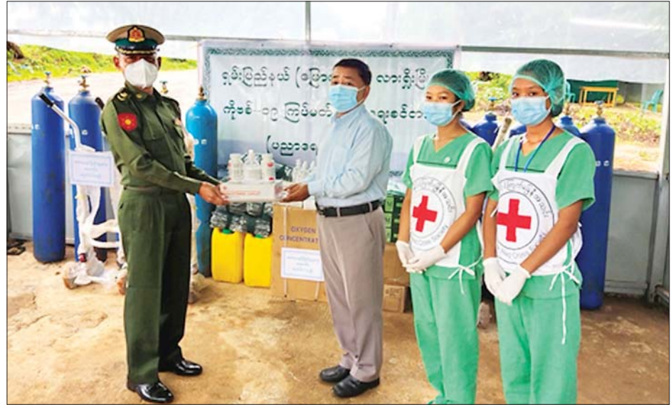
ရှမ်းပြည်နယ်(မြောက်ပိုင်း) လားရှိုးမြို့ရှိ ပညာရေးဒီဂရီကောလိပ်၌ အိမ်သုံးအားဆေးများနှင့် ကိုဗစ်-၁၉ ရောဂါ ကာကွယ်ရေးအထောက်အကူပြုပစ္စည်းများအား ပေးအပ်လှူဒါန်းစဉ်။

ထိုသို့ လှူဒါန်းလျက်ရှိရာ (မြောက်ပိုင်း) လားရှိုးမြို့ရှိ ပညာ ထားသော ကိုဗစ်-၁၉ ရောဂါ ယနေ့တွင် ရှမ်းပြည်နယ် ရေး ဒီဂရီကောလိပ်၌ ဖွင့်လှစ် ကြပ်မတ်ကုသရေး စင်တာနှင့်