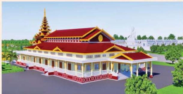
ဓမ္မာရုံ(၂၀၃x၉၀)ပေ ၁ လုံး-၈၇၀၀ သိန်း