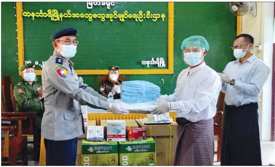
Googles မျက်မှန် အခု ၃၀၊ လည်ရှည်ဖိနပ် ၁၅ ရုံ၊ ပိုးသတ်ဆေးရည် ၁၀ ဂါလန်၊ ဆေးဖျန်းပုံး လေးပုံး၊ အပူချိန်တိုင်းစက် ရှစ်လုံး၊ လက်ဆေးဘေစင်ရှစ်ခု၊ အမှိုက်ပုံးကြီး ၁၉ လုံး၊ အမှိုက်အိတ် ၁၉ အိတ်၊ အိမ်သာဆေးရည် ပုလင်း ၃၀၊ အရက်ပြန် ပုလင်း ၂၀၊ ထီးမကြီး ရှစ်ခု၊ အကြမ်းစီးဖိနပ် အရံ ၃၀၊ လက်ကိုင်အသံချဲ့စက် လေးခု၊ လက်ဖျန်းဆေးဘူး ၃၀၊ လက်ဆေးဆပ်ပြာရည်ဘူး ၃၀၊ ဗီတာမင်ဆေး အလုံး ၃၀၀၀ စုစုပေါင်းတန်ဖိုးငွေကျပ် ၄၃ သိန်း ၈ သောင်းရှိသော အထောက်အကူပြုပစ္စည်းများကို ထောက်ပံ့ပေးအပ်ကြောင်း သိရသည်။ နန်းသာရီ-ထိန်ဝင်း(ပြန်/ဆက်)

ဒုတိယဗိုလ်မှူးကြီးနှင့် မြို့နယ်စီမံအုပ်ချုပ်ရေးအဖွဲ့အတွင်းရေးမှူးနှင့် အဖွဲ့ဝင်များက မြို့နယ်အတွင်း ကိုဗစ်-၁၉ အတည်ပြုလူနာများအတွက် ဖွင့်လှစ်ထားရှိသော အထက-တနင်္သာရီနှင့် တနင်္သာရီခန်းမ စောင့်ကြည့်စင်တာ၊ တကူကျေးရွာအုပ်စု-အလက (ခွဲ)သံတိုက် စောင့်ကြည့်စင်တာ၊ အရှေ့မော်တုန်းကျေးရွာအုပ်စု အထက - မော်တုန်းကျေးရွာ စောင့်ကြည့်စင်တာ၊ ညောင်ပင်ကွင်းကျေးရွာအုပ်စု အထက - ညောင်ပင်ကွင်း စောင့်ကြည့်စင်တာ၊ မောတောင်မြို့ အားကစားခန်းမနှင့် ကျေးလက်ကျန်းမာရေးဌာန စောင့်ကြည့်စင်တာများအတွက် ကိုဗစ်-၁၉ ရောဂါ ကာကွယ်၊ ထိန်းချုပ်ရေးအထောက်အကူပြုပစ္စည်းများကို ထောက်ပံ့ပေးအပ်ရာ သက်ဆိုင်ရာပရဟိတအဖွဲ့ စေတနာရှင်ကိုယ်စားလှယ်များက လက်ခံယူကြောင်း သိရသည်။ ထို့ပြင် ရောဂါကာကွယ်ရေးဝတ်စုံ ၅၀၊ N-95 နှာခေါင်းစည်း အခု ၁၀၀၀၊ ခွဲစိတ်ခန်းသုံး နှာခေါင်းစည်း အခု ၁၀၀၀၊ လက်သန့်ဆေးရည်ဘူး ၃၀၊ ရှေ့ဖုံးခါးစည်း အခု ၁၀၀၊ မျက်နှာအကာ အခု ၁၀၀၊ ခွဲစိတ်ခန်းသုံးခေါင်းစွပ် အခု ၅၀၊ ခွဲစိတ်ခန်းသုံးဝတ်စုံ ၈၃ ခု၊ တစ်ခါသုံးလက်အိတ် အခု ၂၅၀၊