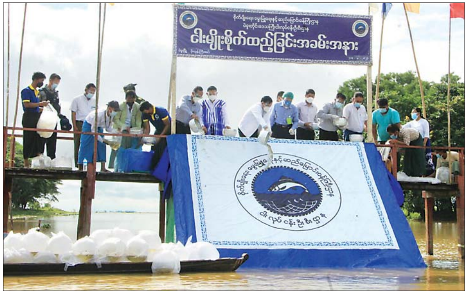
ပဲခူးတိုင်းဒေသကြီး ဝန်ကြီးချုပ် ဦးမျိုးဆွေဝင်း မိုးယွန်းကြီးအင်းအတွင်း ငါးမျိုးစိုက်ထည့်ပေးစဉ်။