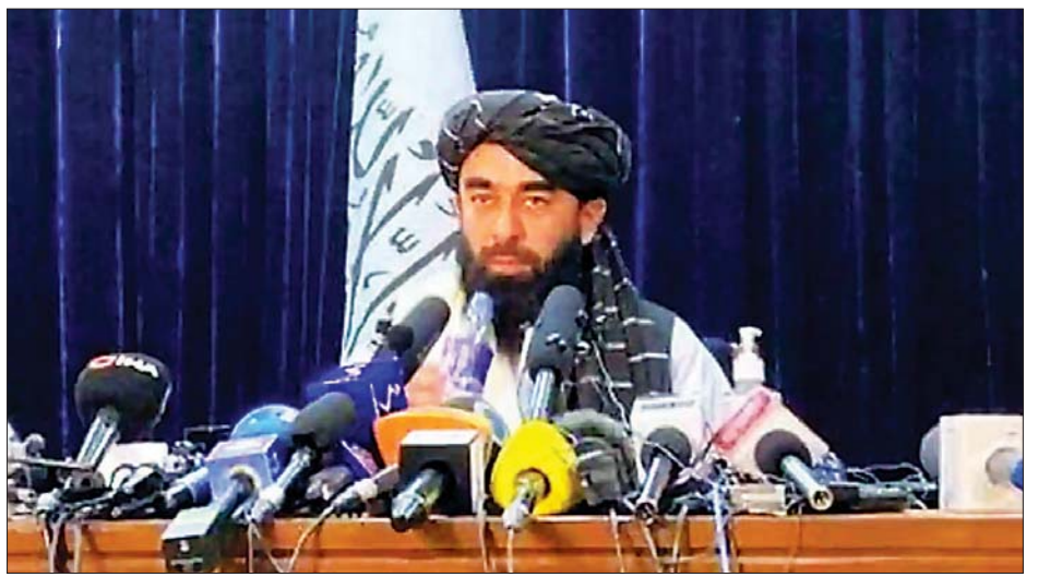
တာလီဘန်ပြောရေးဆိုခွင့်ရှိသူ ဇာဘီဟူလာ မူဂျာဟစ် ဩဂုတ် ၁၇ ရက်က ပထမဆုံးအကြိမ် သတင်းစာ ရှင်းလင်းပွဲ ပြုလုပ်နေစဉ်။

လက်အောက်တွင် ငြိမ်းချမ်းရေးလုပ်ငန်းစဉ်ကို ဦးဆောင်နေသူဖြစ်သည်။ တာလီဘန်ပြောရေးဆိုခွင့်ရှိသူ ဇာဘီဟူလာ မူဂျာဟစ်က တာလီဘန်ပြည်နယ်တည်ထောင်ရေး အတွက် မကြာမီ သဘောတူညီချက်ရရှိတော့မည် ဖြစ်ကြောင်း ဩဂုတ် ၁၇ ရက်က ပြောကြားလိုက်သည်။ သမ္မတ ဂါနီသည် နိုင်ငံတွင်းမှ ထွက်ပြေးလျက် ရှိသည်။ ပထမ ဒုတိယသမ္မတ အမ်ရူလာဆာလေက ဩဂုတ် ၁၇ ရက်က သူ့အနေဖြင့် အာဖဂန်နစ္စတန် အတွင်းမှာပင်ရှိသေးကြောင်း တွစ်တာတွင် ပြော ကြားလိုက်ပြီး သူ့ကိုယ်သူ တရားဝင်နိုင်ငံတော်ကို စောင့်ရှောက်ရမည့်သူဖြစ်ကြောင်း ကြေညာလိုက် သည်။ ထို့အပြင် ပြည်သူများကိုလည်း တာလီဘန် များကို ခုခံတွန်းလှန်ကြရန် တိုက်တွန်းပြောကြား လိုက်သည်။ ယခုအချိန်တွင် တာလီဘန်များသည် မြို့တော် ကဘူးလ်အပါအဝင် နိုင်ငံ၏အစိတ်အပိုင်းအများစုကို