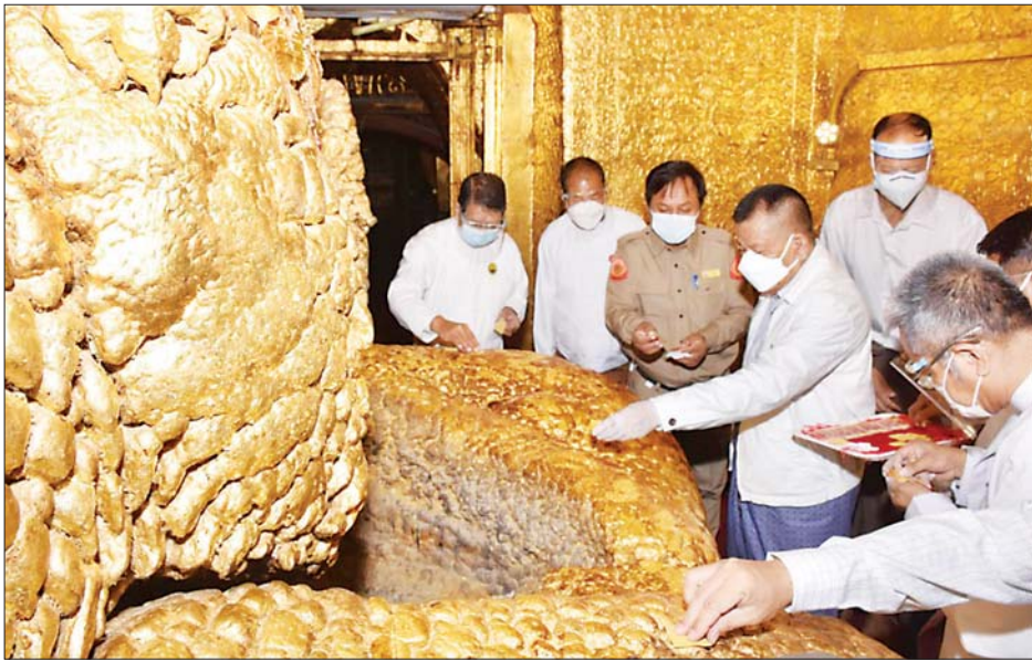
ဆောင်ရွက်နေမှုများ၊ ကူးစက်ရောဂါကျဆင်းလာမှု အခြေအနေများ၊ အောက်ဆီဂျင် လုံလောက်စွာရ ရှိရေးအတွက် စက်ရုံများတည်ဆောက်နေမှုအခြေ အနေများ၊ မန္တလေးခရိုင်ရှိ ကျောင်းတိုက်များမှ

၎င်းနောက် တိုင်းဒေသကြီး ဝန်ကြီးချုပ်နှင့် အဖွဲ့သည် မဟာမုနိရုပ်တော်မြတ်အား ပန်း၊ ဆီမီး၊ ရေချမ်း၊ ရွှေသင်္ကန်းများ ကပ်လှူပူဇော် ၍(ယာပုံ) ဘုရားကြီးရှိ မိုးကောင်းမေတ္တာရုံတွင် နိုင်ငံတော်သံဃမဟာနာယကအဖွဲ့ဥက္ကဋ္ဌ အဘိဓဇ မဟာရဋ္ဌဂုရု ဒေါက်တာ ဘဒ္ဒန္တ ကုမာရာဘိဝံသ ဗန်းမော်ဆရာတော်ကြီး အမှူးပြုသော နိုင်ငံတော် ဩဝါဒစရိယဆရာတော်ကြီးများနှင့် မဟာမုနိဩဝါဒါ စရိယ ဆရာတော်ကြီးများအား ဖူးမြော်ကာ မန္တလေးတိုင်းအတွင်း ကိုဗစ်-၁၉ရောဂါ ကာကွယ် ထိန်းချုပ်ရေးလုပ်ငန်းများနှင့် ပတ်သက်၍