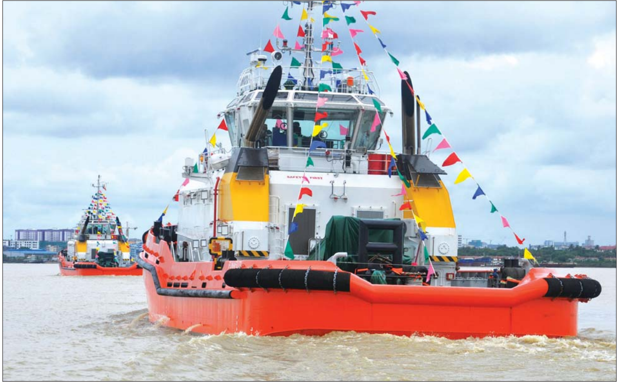
တရုတ်ပြည်သူ့သမ္မတနိုင်ငံမှ မှာယူခဲ့သည့် တွန်း/ဆွဲ ရေယာဉ်သစ်နှစ်စင်း ရန်ကုန်မြို့၊ ပန်းဆိုးတန်း နန်းသီတာ ဆိပ်ကမ်းသို့ ရောက်ရှိလာမှုကို တွေ့ရစဉ်။