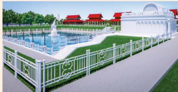
မုစလိန္နအိုင်

၁။ နိုင်ငံတော်စီမံအုပ်ချုပ်ရေးကောင်စီဥက္ကဋ္ဌ၊ တပ်မတော်ကာကွယ်ရေးဦးစီးချုပ် ဗိုလ်ချုပ်မှူးကြီးမင်းအောင်လှိုင် ဦးဆောင်သည့် (၇)ရက်သား၊ သမီး၊ ဘုရားဒါယကာ၊ ဒါယိကာမတို့က မာရဝိဇယဗုဒ္ဓရုပ်ပွားတော်မြတ်ကြီးအား မြန်မာနိုင်ငံတွင် ထေရဝါဒဗုဒ္ဓသာသနာတော်ထွန်းလင်းတောက်ပလျက်ရှိသည်ကို ကမ္ဘာကိုပြသရန်၊ တိုင်းပြည်အေးချမ်းသာယာမှုရှိစေရန်၊ ရုပ်ပွားတော်မြတ်ကြီးအား ပြည်တွင်း၊ ပြည်ပဘုရားဖူးများလာရောက်ခြင်းဖြင့် ဒေသတိုးတက်စည်ကားမှုကို အထောက်အကူဖြစ်စေရန်၊ နိုင်ငံတော်ဖွံ့ဖြိုးတိုးတက်မှုအား အထောက်အကူ ဖြစ်စေရန်ရည်သန်လျက် ပြည်ထောင်စုနယ်မြေ နေပြည်တော်၊ ဒဂုံ၊ ကသာ၊ သီရိမြို့နယ်အတွင်း၌ သာသနာတော်ထုံး၊ ရုပ်ပွားဆင်းတုတော်ထုံး၊ မြန်မာ့ရိုးရာတည်ထုံးများနှင့်အညီ တည်ဆောက် ပူဇော်လျက်ရှိပါသည်။