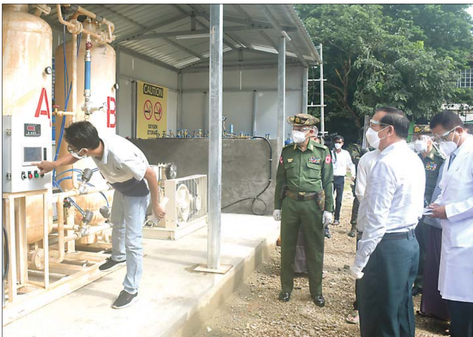
နေရာတို့ကို ကြည့်ရှုစစ်ဆေးရာ တိုင်းဒေသကြီး စီးပွားရေးရာဝန်ကြီး ဦးအောင်သန်းဦးနှင့် တာဝန်ရှိသူများက ရှင်းလင်းတင်ပြသည်။ စင်တာအသီးသီးရှိ တာဝန်ရှိသူများ၏ ရှင်းလင်းတင်ပြချက်များအပေါ် ဝန်ကြီးချုပ်က လိုအပ်သည်များ မှာကြားပြီး သက်ဆိုင်ရာဌာနများနှင့် ပေါင်းစပ်ညှိနှိုင်းဆောင်ရွက်ပေးကြောင်း သိရသည်။ ဆန်းကျော်ဦး(ပြန်/ဆက်)

ဆက်လက်၍ သယ်နန်းကျွန်းမြို့နယ် သုဝဏ္ဏမြို့ဦးစေတီအားကစားကွင်းရှိ တိုင်းဒေသကြီးအစိုးရအဖွဲ့က ထပ်မံတည်ဆောက်နေသော ကိုဗစ် - ၁၉ ပိုးတွေ့လူနာ ၃၆၀ ကုသနိုင်သည့် အဆောက်အအုံ သစ်သုံးလုံးနှင့် အဆိုပါစင်တာတွင် အသုံးပြုမည့် အောက်ဆီဂျင်စက်အသစ်တစ်လုံး တပ်ဆင်မည့်