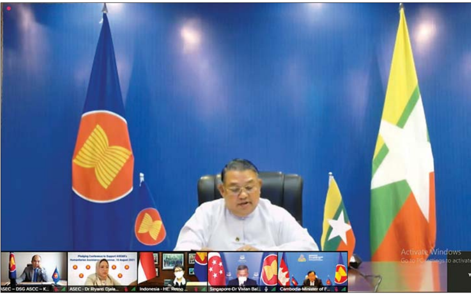
ပြည်ထောင်စုဝန်ကြီး ဦးဝဏ္ဏမောင်လွင် Video Conference စနစ်ဖြင့် ကျင်းပသည့် အာဆီယံမှ မြန်မာနိုင်ငံသို့ လူသားချင်း စာနာထောက်ထားမှု အကူအညီပေးမည့်ကိစ္စနှင့် ပတ်သက်သည့် Pledging Conference သို့ တက်ရောက်စဉ်။

နေပြည်တော် ဩဂုတ် ၁၈ နိုင်ငံခြားရေးဝန်ကြီးဌာန ပြည်ထောင်စုဝန်ကြီးဦးဝဏ္ဏမောင်လွင်သည် ယနေ့မနက် ၁၂ နာရီခွဲတွင် Video Conference စနစ်ဖြင့် ကျင်းပသည့် အာဆီယံမှ မြန်မာနိုင်ငံသို့ လူသားချင်း စာနာထောက်ထားမှုအကူအညီပေးမည့် ကိစ္စနှင့် ပတ်သက်သည့် Pledging Conference သို့ နိုင်ငံခြားရေးဝန်ကြီးဌာန၊ နေပြည်တော်မှ တက်ရောက်သည်။