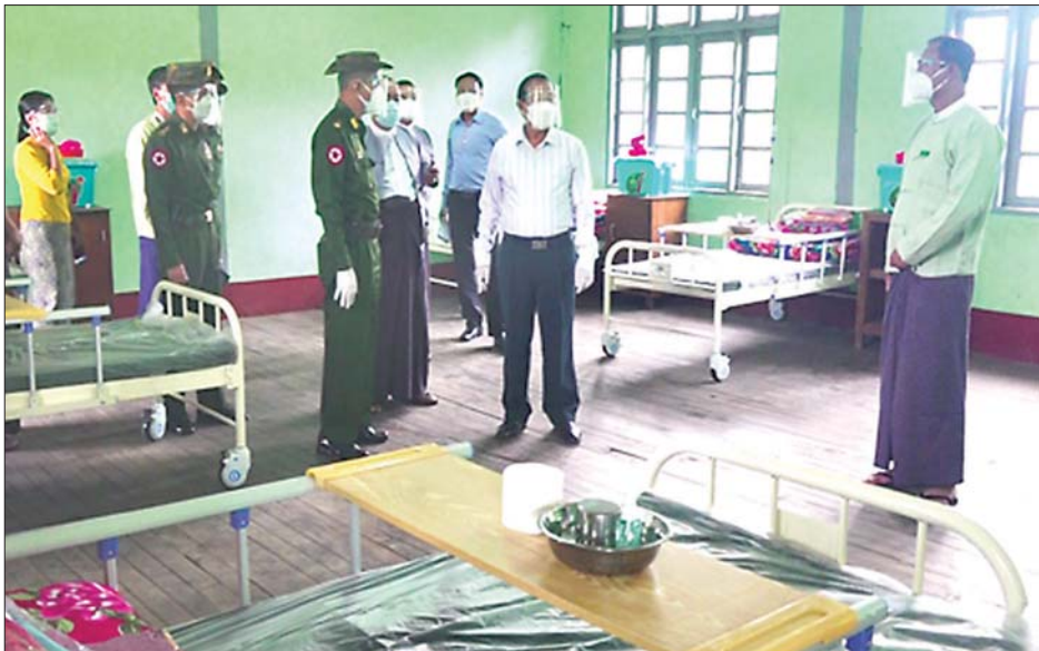
ပညာဦးစီးဌာနရှိ ပညာရေးစီမံခန့်ခွဲမှုသင်တန်း ကျောင်းတွင် အဆောင်လေးဆောင်ရှိ ပြင်ဆင် ဆောင်ရွက်ထားရှိမှုများ၊ အောက်ဆီဂျင်လိုအပ်မည့် သူများအတွက် အောက်ဆီဂျင်ပိုက်လိုင်းသွယ်တန်း တပ်ဆင်ထားရှိမှုနှင့် လူဦးရေ ၃၀၀ ထားရှိမည့် အခြေအနေများကို ရန်ကုန်တိုင်းဒေသကြီး ဝန်ကြီးချုပ် ဦးလှစိုး၊ ရန်ကုန်တိုင်းစစ်ဌာနချုပ် တိုင်းမှူး ဗိုလ်ချုပ် ညွှန်ကြားရေးမှူးချုပ် ဦးအောင်ကျော်၊ အောက်ဆီဂျင်လိုအပ်မည့် သူများက ယနေ့တွင် သွားရောက်ကြည့်ရှုပြီး လိုအပ် သည့်များ ညှိနှိုင်းဆောင်ရွက်ပေးခဲ့ကြောင်း သတင်းရရှိသည်။ (အပေါ်ပုံ) သတင်းစဉ်

လိုအပ်သည်များ ညှိနှိုင်းဆောင်ရွက်ပေးသည်။ ထိုသို့ ပြင်ဆင်လက်ခံ ဆောင်ရွက်ပေးလျက် ရှိရာ ယနေ့ ည ၇ နာရီအထိ နေပြည်တော် စစ်ကြော ရေးနှင့်တည်းခိုရေးစခန်း၌ သီးသန့်စောင့်ကြည့်ရမည့် သူ အမျိုးသား ၂၂၁ ဦးနှင့် အမျိုးသမီး ၁၄၂ ဦး စုစု ပေါင်း ၃၆၃ ဦးကို လည်းကောင်း၊ ဥတ္တရသီရိမြို့နယ် ရှိ နယ်မြေခံတပ်၌ ဓာတ်ခွဲအတည်ပြုပိုးတွေ့လူနာ အမျိုးသား ကိုးဦး၊ အမျိုးသမီး နှစ်ဦး စုစုပေါင်း ၁၁ ဦးတို့ကိုလည်းကောင်း၊ ရန်ကုန်တိုင်းဒေသကြီး လှိုင်မြို့နယ်စစ်ကြောရေးနှင့် တည်းခိုရေးစခန်း၌ ဓာတ်ခွဲအတည်ပြု ပိုးတွေ့လူနာ အမျိုးသား ၁၃၀ နှင့် အမျိုးသမီး ၁၁၉ ဦး စုစုပေါင်း ၂၄၉ ဦးကို လည်းကောင်း၊ ရဲမန်တပ်မြို့ရှိ နယ်မြေခံတပ်၌ ဓာတ်ခွဲအတည်ပြု ပိုးတွေ့လူနာအမျိုးသား ၄၃ ဦး နှင့် အမျိုးသမီး ၂၅ ဦး စုစုပေါင်း ၆၈ ဦးကို လည်းကောင်း အသီးသီး လက်ခံထားရှိကြောင်း သိရသည်။ အဆိုပါ စောင့်ကြည့်လူနာများနှင့် ဓာတ်ခွဲ အတည်ပြု ပိုးတွေ့လူနာများ၏ နေထိုင်စားသောက် ရေးနှင့် ကျန်းမာရေးစောင့်ရှောက်မှုလုပ်ငန်းများ၊ ပြည်ပနိုင်ငံများမှ ပြန်လည်ဝင်ရောက်လာသူများကို ထားရှိရန်ပြင်ဆင်နေသည့် မင်္ဂလာဒုံမြို့နယ် အခြေခံ