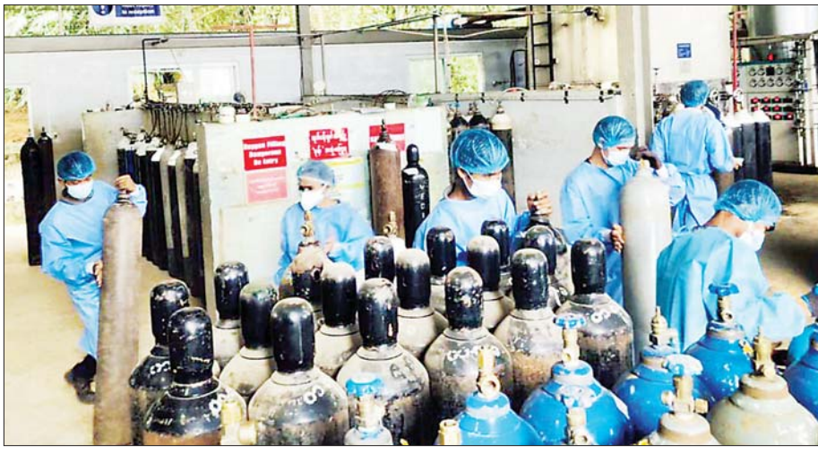
မြန်မာ့စီးပွားရေးကော်ပိုရေးရှင်းရှိ စက်ရုံမှ ထုတ်လုပ်သည့် အောက်ဆီဂျင်အိုးများကို သက်ဆိုင်ရာ နေရာများသို့ ဖြန့်ဝေပေးစဉ်။

ငြိမ်းချမ်းရေးနှင့်တရားဥပဒေစိုးမိုးရေး ပစ်ခတ်တိုက်ခိုက်မှုရပ်စဲရေးနှင့် ထာဝရ ငြိမ်းချမ်းရေးအတွက် နိုင်ငံတစ်ဝန်းလုံး၌ နိုင်ငံတော် ကာကွယ်ရေးနှင့် အုပ်ချုပ်မှုဆိုင်ရာကိစ္စရပ်များ အပြင် နိုင်ငံတော်အစိုးရ၏ လုံခြုံရေးနှင့် အုပ်ချုပ် ရေးယန္တရားများအား နေ့စဉ်ယုတ်ထိပါးတိုက်ခိုက် ချိန်မှအပ တပ်မတော်၏ စစ်ရေးဆိုင်ရာကိစ္စရပ်များ ကို ဧပြီလ ၁ ရက်မှ ၃၁ ရက်အထိနှင့် ထပ်မံ၍ လည်း ဩဂုတ်လ ၁ ရက်မှ စက်တင်ဘာလ ၃၀ ရက် အထိ ထပ်မံတိုးမြှင့်ရပ်ဆိုင်းပေးသွားမည်ဖြစ် ကြောင်း ဝမ်းမြောက်ဖွယ်သိရှိရပါသည်။