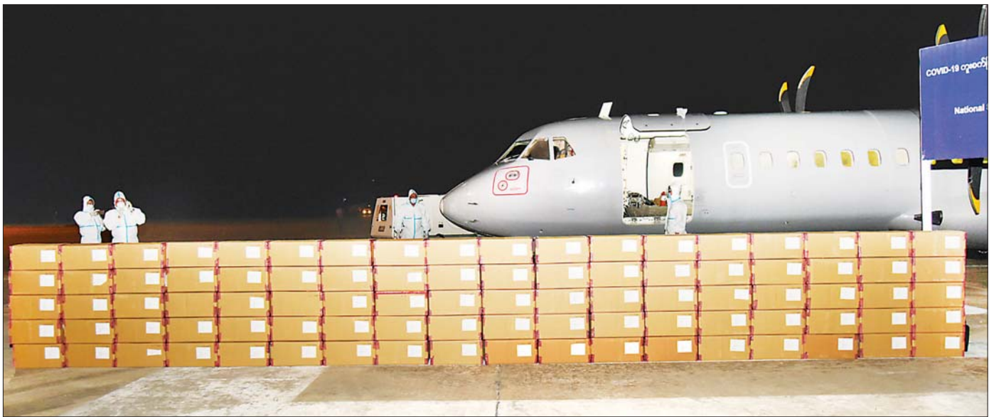
ကိုဗစ်-၁၉ ကူးစက်မြန်ရောဂါ အရေးပေါ်ကုသရာတွင် အသုံးပြုရန်အတွက် အိန္ဒိယနိုင်ငံ National Strategic Investment Corporation Co.Ltd(NSIC) မှ နိုင်ငံတော်စီမံအုပ်ချုပ်ရေးကောင်စီသို့ လှူဒါန်းသည့် Remdesivir ကုသဆေးများ နေပြည်တော်လေဆိပ်သို့ ဇူလိုင် ၂၀ ရက်က ရောက်ရှိလာစဉ်။

အောက်ဆီဂျင်လိုအပ်ချက် ပြည့်မီစေရေးအတွက် မြန်မာ့စီးပွားရေးကော်ပိုရေးရှင်း၊ မင်းဓမ္မအောက်ဆီဂျင်ဓာတ်ငွေ့စက်ရုံမှ တစ်ရက်လျှင် အောက်ဆီဂျင်ကုဗပေ ၁၄၉၀၀၀ ကျော်နှင့် မြောင်း