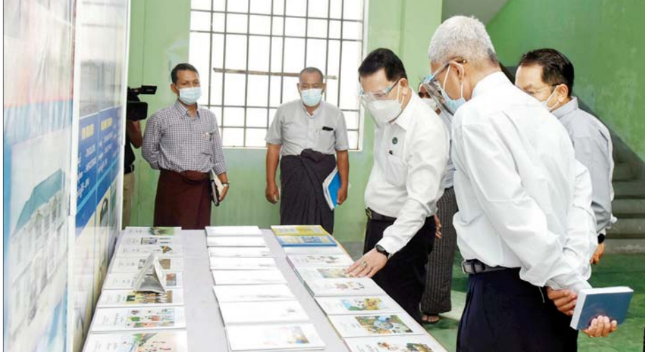
ပြည်ထောင်စုဝန်ကြီး ဦးမောင်မောင်အုန်း နေပြည်တော်ပုံနှိပ်စက်ရုံတွင် ကျောင်းသုံးပုံနှိပ်စာအုပ်များ ပုံနှိပ်ထားရှိမှုကို ကြည့်ရှုစစ်ဆေးစဉ်။

နိုင်ငံပိုင်သတင်းစာတိုက်များနှင့် နေပြည်တော် ပုံနှိပ်စက်ရုံတို့မှ ဝန်ထမ်းများနှင့် တွေ့ဆုံစဉ် ပြည်ထောင်စုဝန်ကြီး ဦးမောင်မောင်အုန်းက မိမိတို့ နိုင်ငံပိုင်မီဒီယာများသည် နိုင်ငံတော်အစိုးရနှင့်ပြည်သူများအကြား အပြန်အလှန် ပေါင်းကူးဆက်သွယ်ခြင်း သာမက ပြည်ပနိုင်ငံများကပါ မိမိတို့၏ သတင်းမှန်၊ အခြေအနေမှန်များကို သိရှိစေရန် ကြိုးပမ်းဆောင်ရွက်သွားရမည်ဖြစ်ကြောင်း၊ ယခုအခါ အိမ်စောင့်အစိုးရအဖွဲ့ ဖွဲ့စည်းပြီး နိုင်ငံတော်စီမံအုပ်ချုပ်ရေးကောင်စီက ချမှတ်ထားသည့် ရှေ့လုပ်ငန်းစဉ်(၅)ရပ်နှင့် ဦးတည်ချက် (၉) ရပ်တို့ကို မူဝါဒအဖြစ် ကြိုးပမ်းအကောင်အထည်ဖော် ဆောင်ရွက်နေမှုများအား ပြည်တွင်းပြည်ပ သိရှိအောင် သတင်းမှန်ပြန်ကြားခြင်းကို မှန်မှန်ကန်ကန်၊ မြန်မြန်ဆန်ဆန် ဆောင်ရွက်ကြရန်ဖြစ်ကြောင်း၊ နိုင်ငံတော်ဝန်ကြီးချုပ်ကိုယ်တိုင် ပုံနှိပ်မီဒီယာအပါအဝင် မီဒီယာ၏ အခန်းကဏ္ဍကို အထူးအလေးထားပါကြောင်း၊ ပြောင်းလဲတိုးတက်လာသော နည်းပညာများဖြင့် မီဒီယာကဏ္ဍကို ပိုမိုဖွံ့ဖြိုးတိုးတက်အောင် ဆောင်ရွက်ကာ ပြည်သူများ၏ သတင်းအချက်အလက်သိရှိပိုင်ခွင့်ကို ပိုမို