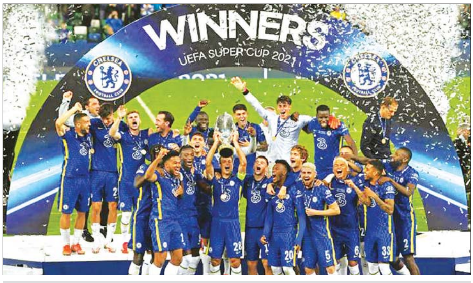
ချယ်ဆီးအသင်းသားများ ဆုဖလားနှင့်အတူ အောင်ပွဲခံနေစဉ်။

ယူအီးအက်ဖ်အေ စူပါဖလား ဗိုလ်လုပွဲအဖြစ် ဩဂုတ် ၁၂ ရက် နံနက်ပိုင်းက ပရီမီယာလိဂ်ကလပ် ချယ်ဆီးအသင်းနှင့် စပိန်ကလပ် ဗီလာရီးရဲအသင်းတို့ ပွဲစဉ်ကို မြောက်အိုင်ယာနိုင်ငံ ဘဲလ်ဖတ်ရှိ ဝင်ဆာပတ်ခ် အားကစားကွင်း၌ အကြိတ်အနယ် ယှဉ်ပြိုင်ကစားခဲ့ရာ ချယ်ဆီးအသင်းက ပယ်နယ် တီအဆုံးအဖြတ်တွင် ခြောက်ဂိုး-ငါးဂိုးဖြင့်အနိုင်ရရှိကာ စူပါဖလားကို အသင်းသမိုင်း တစ်လျှောက် နှစ်ကြိမ်မြောက် ဆွတ်ခူးနိုင်ခဲ့သည်။ စာမျက်နှာ ၁၉ ကော်လံ ၃ ◆