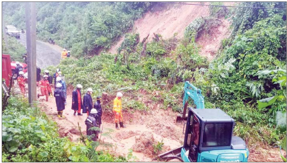
ကမ်းပါးယံပြိုကျမှုကြောင့် လမ်းပိတ်ဆို့မှုကို ရှင်းလင်းနေစဉ်။

ကယ်ဆယ်ရေးလုပ်ငန်းများ ဆောင်ရွက်ပြီး မြို့နယ်ပြည်သူ့ဆေးရုံသို့ပို့ဆောင်ပေးကြောင်း သိရသည်။ အလားတူ မိုးရွာသွန်းမှုကြောင့် မိုးကုတ်မြို့အရှေ့ပိုင်း ညောင်သုံးပင် - ရေပူသွားကားလမ်းတွင် ကမ်းပါးယံပြိုကျမှုကြောင့် လမ်းပိတ်ဆို့မှုဖြစ်ပွား၍ မြို့နယ်စည်ပင်သာယာရေးကော်မတီ၊ မြို့နယ်မီးသတ်တပ်ဖွဲ့၊ အရန်မီးသတ်တပ်ဖွဲ့များမှ ပူးပေါင်းဆောင်ရွက်ပြီး အဆိုပါဖြစ်စဉ်ကြောင့် ပျက်စီးဆုံးရှုံးမှုမရှိကြောင်း သိရသည်။ နန်းရွာညိုနှင့်(ပြန်/ဆက်)