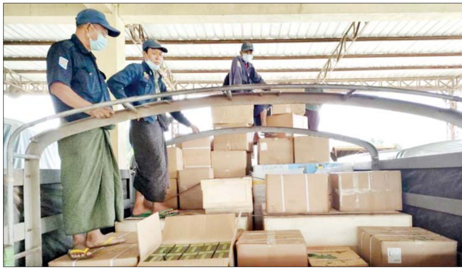
မူဆယ်နယ်စပ်ကုန်သွယ်ရေးစခန်းမှ ကိုဗစ်-၁၉ ကာကွယ်ရေးပစ္စည်းများ တင်ဆောင်လာသည့် မော်တော်ယာဉ်ကို တွေ့ရစဉ်။

၂၀၂၁ ခုနှစ် ဇူလိုင်လမှ ဩဂုတ် ၁၂ ရက်ထိ ပြည်ပ မှတင်သွင်းလာသည့် အောက်ဆီဂျင်အရည်(Bowser) ယာဉ် စုစုပေါင်း ၆၅ စီးမှာ ရန်ကုန်မြို့သို့ ၄၈ စီး၊ မန္တလေးမြို့သို့ ၁၁စီး၊ ပဲခူးမြို့သို့ နှစ်စီး၊ မော်လမြိုင်