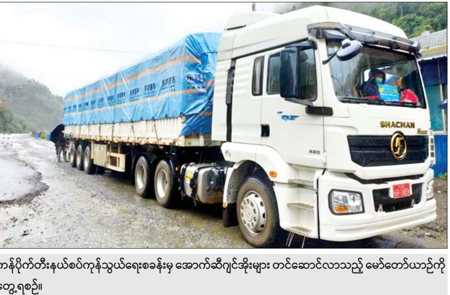
ကန်ပိုက်တီးနယ်စပ်ကုန်သွယ်ရေးစခန်းမှ အောက်ဆီဂျင်အိုးများ တင်ဆောင်လာသည့် မော်တော်ယာဉ်ကို တွေ့ရစဉ်။

မြို့သို့ သုံးစီး၊ သထုံမြို့သို့ တစ်စီးဖြစ်ကြောင်း သိရ သည်။ Oxygen Plant စုစုပေါင်း ၂၈ ခုမှာ ရန်ကုန်မြို့ သို့ လေးခု၊ လားရှိုးငါးခု၊ ပဲခူးမြို့သို့ လေးခု၊ ပခုက္ကူ နှစ်ခု၊ မန္တလေးမြို့နှစ်ခု၊ ဘားအံနှစ်ခု၊ မော်လမြိုင်မြို့ နှစ်ခု၊ တောင်ကြီး၊ သံဖြူဇရပ်၊ မကွေး၊ ထားဝယ်၊ ဝါးခယ်မ၊ မြစ်သာ၊ ကျောက်ပန်းတောင်းမြို့များသို့ တစ်ခုစီ ဖြစ်ကြောင်း သိရသည်။ စီးပွားရေးနှင့်ကူးသန်းရောင်းဝယ်ရေးဝန်ကြီး ဌာနအနေဖြင့် အများပြည်သူရုံးပိတ်ရက်များအဖြစ် သတ်မှတ်ကြေညာထားသည့် ဩဂုတ် ၉ ရက်နေ့မှ ၁၅ ရက်အထိ ရုံးပိတ်ရက်များတွင်လည်း နယ်စပ် ကုန်သွယ်ရေးစခန်းများအနေဖြင့် အလုပ်တာဝန်များ ရပ်ဆိုင်းထားမည်မဟုတ်ဘဲ ပုံမှန်အတိုင်း ပို့ကုန် သွင်းကုန်လုပ်ငန်းများ ဆောင်ရွက်ပေးသွားမည် ဖြစ်ကြောင်းနှင့် ကိုဗစ်-၁၉ ကူးစက်ရောဂါ ကာကွယ် ကုသရေးပစ္စည်းများ တင်သွင်းမှုများကိုလည်း သက်ဆိုင်ရာဌာနများနှင့် ညှိနှိုင်းထားသည့် SOP များနှင့်အညီ ဦးစားပေး တင်သွင်းခွင့်ပြုပေးမည် ဖြစ်ပြီး အဆိုပါရက်များတွင်လည်း ကုန်သွယ်ရေး ဦးစီးဌာန (ရုံးချုပ်) ပို့ကုန်သွင်းကုန်လုပ်ငန်းဌာနခွဲ နှင့် ပို့ကုန်သွင်းကုန်ရုံး(ရန်ကုန်)တို့မှ အွန်လိုင်းစနစ် ဖြင့် ပို့ကုန်သွင်းကုန်လိုစင် လျှောက်ထားမှုများကို လည်း ရုံးချိန်အတွင်းပုံမှန်အတိုင်း ခွင့်ပြုဆောင်ရွက် ပေးသွားမည်ဖြစ်ကြောင်း ဩဂုတ် ၈ ရက်နေ့စွဲဖြင့် အသိပေးကြေညာချက်ထုတ်ပြန်ထားကြောင်း သိရ သည်။ သတင်းစဉ်