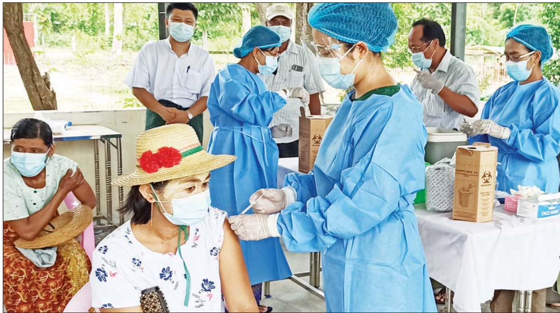
စစ်ကိုင်းတိုင်းဒေသကြီး ကျွန်းလှမြို့နယ်၌ ကိုဗစ်-၁၉ ကာကွယ်ဆေးထိုးနှံပေးစဉ်။