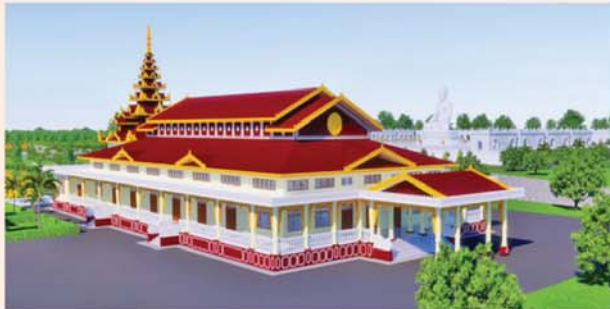
ဓမ္မာရုံ(၂၀၃x၉၀)ပေ ၁ လုံး-၈၇၀၀ သိန်း