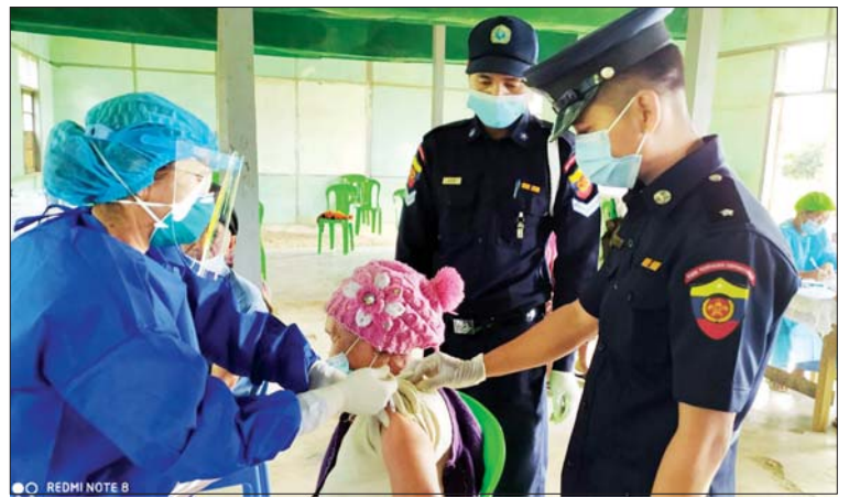
ချင်းပြည်နယ် မတူဝီမြို့။