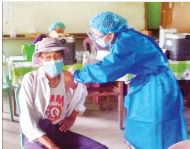
ရန်ကုန်တိုင်းဒေသကြီး သစ်ခင်းကျွန်းမြို့နယ်။ စန္ဒာမိုး(ပြန်/ဆက်)