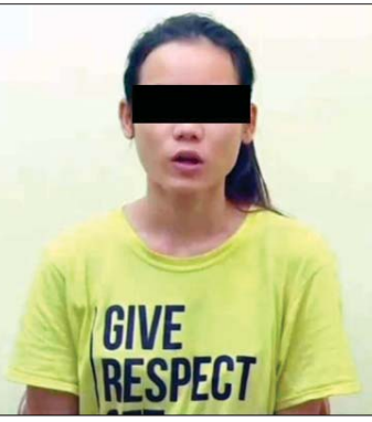
ပိုးကျော့ကျော့ခန့်

ဆက်လက်၍ သီဟကောင်းဆက် အား စစ်ဆေးချက်အရ “ကျွန်တော့်