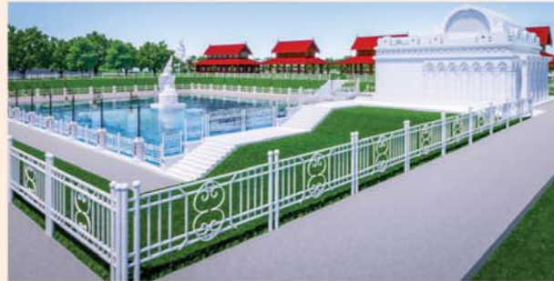
မုစလိန္နုအိုင်

၁။ နိုင်ငံတော်စီမံအုပ်ချုပ်ရေးကောင်စီဥက္ကဋ္ဌ၊ တပ်မတော်ကာကွယ်ရေးဦးစီးချုပ် ဗိုလ်ချုပ်မှူးကြီးမင်းအောင်လှိုင် ဦးဆောင်သည့် (၇)ရက်သား၊ သမီး၊ ဘုရားဒါယကာ၊ ဒါယိကာမတို့က မာရဝိဇယဗုဒ္ဓရုပ်ပွားတော်မြတ်ကြီးအား မြန်မာနိုင်ငံတွင် ထေရဝါဒဗုဒ္ဓသာသနာတော်ထွန်းလင်းတောက်ပလျက်ရှိသည်ကို ကမ္ဘာကိုပြသရန်၊ တိုင်းပြည်အေးချမ်းသာယာမှုရှိစေရန်၊ ရုပ်ပွားတော်မြတ်ကြီးအား ပြည်တွင်း၊ ပြည်ပဘုရားဖူးများလာရောက်ခြင်းဖြင့် ဒေသတိုးတက်စည်ကားမှုကို အထောက်အကူဖြစ်စေရန်၊ နိုင်ငံတော်ဖွံ့ဖြိုးတိုးတက်မှုအား အထောက်အကူ ဖြစ်စေရန်ရည်သန်လျက် ပြည်ထောင်စုနယ်မြေ နေပြည်တော်၊ ဒဂုံ၊ ကသာ၊ သီရိမြို့နယ်အတွင်း၌ သာသနာတော်ထုံး၊ ရုပ်ပွားဆင်းတုတော်ထုံး၊ မြန်မာ့ရိုးရာတည်ထုံးများနှင့်အညီ တည်ဆောက် ပူဇော်လျက်ရှိပါသည်။