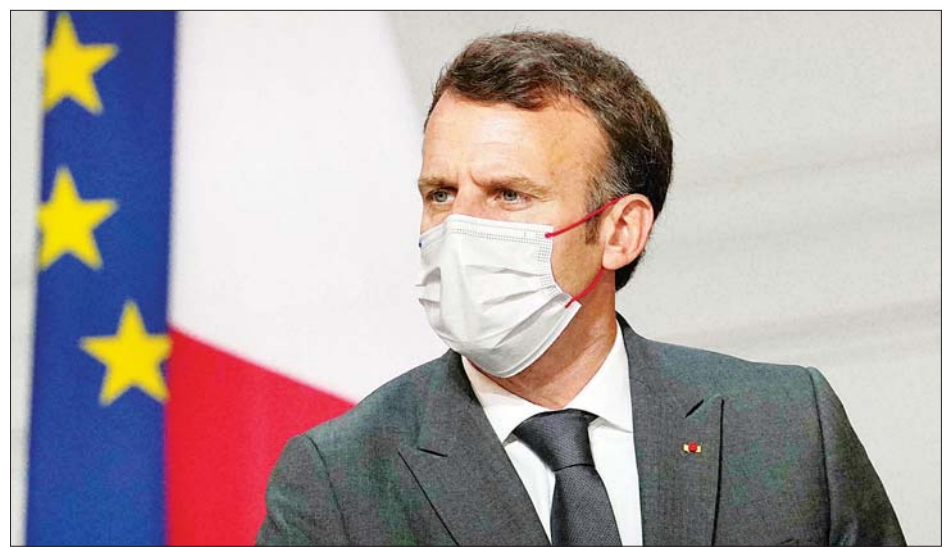
ပြင်သစ်သမ္မတ အီမန်နျူရယ် မက်ခရူန်။

ပါရီ ဩဂုတ် ၁၂ ပြင်သစ်နိုင်ငံတွင် ဖြစ်ပွားလျက်ရှိသော ကျန်းမာရေးအကျပ်အတည်းမှာ မပြီးဆုံးသေးကြောင်း ပြင်သစ်သမ္မတ အီမန်နျူရယ် မက်ခရူန်က ဩဂုတ် ၁၁ ရက်တွင် ပြောကြားလိုက်သည်။ ကျန်းမာရေးအကျပ်အတည်းသည် မိမိတို့၏ နောက်တွင် ရှိမနေကြောင်း၊ မိမိတို့အနေဖြင့် နောက်ထပ်လအတော်များများ ဝိုင်းရပ်စ်နဲ့အတူတကွ အသက်ရှင်သန် နေထိုင်ရမည်ဖြစ်ကြောင်း မက်ခရူန်က အွန်လိုင်းဖြင့်ပြောဆိုသော ဝန်ကြီးအစည်းအဝေးတွင် ပြောကြားလိုက်သည်။ ဒယ်လီတာအသွင်ပြောင်း ကိုဗစ်-၁၉ ဝိုင်းရပ်စ်ကြောင့် ကျန်းမာရေးအခြေအနေမှာ ပိုပြီးကိုင်တွယ်ရတာ သိမ်မွေ့လာကြောင်းနှင့် စည်းရုံးမှုရှိရန် လိုအပ်လာကြောင်း မက်ခရူန်က ဆက်လက်ပြောကြားသည်။ ပြင်သစ်နိုင်ငံ၏ ပင်လယ်ရပ်ခြားပိုင်နက် နယ်မြေဒေသများတွင် အခြေအနေ ဆိုးရွားပြင်းထန် လျက်ရှိကြောင်း မက်ခရူန်က သတိပေးပြောကြားလိုက်သည်။ ထို့အပြင် ကိုဗစ်-၁၉ ပြန့်လွှာမှုကို ထိန်းချုပ်ရန်နှင့် တင်းကြပ်သည့် ကန့်သတ်ပိတ်ဆို့