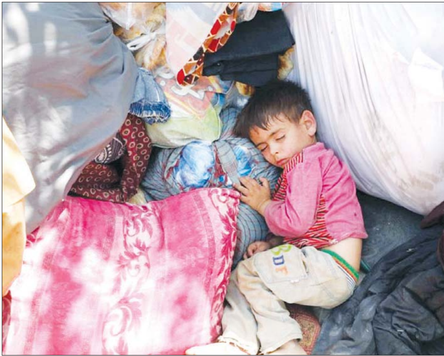
တိုက်ပွဲများ ဖြစ်ပွားနေသဖြင့် သနားစရာ ပြည်တွင်းရွှေ့ပြောင်းကလေးငယ်တစ်ဦးကို တွေ့ရစဉ်။

မိမိတို့ဟာ နှစ်ပေါင်း ၂၀ ကျော်အတွင်းမှာ အမေရိကန်ဒေါ်လာ တစ်ထရီလီယံကျော်ကျော် သုံးစွဲခဲ့ပါတယ်။ ထို့အတူ အာဖဂန်တပ်ဖွဲ့ဝင် ၃၀၀၀၀၀ ကျော်ကိုလည်း လေ့ကျင့်ပေးခဲ့သလို ခေတ်မီစစ်လက်နက်ပစ္စည်းတွေလည်း တပ်ဆင်ပေးခဲ့ပါတယ်။ အာဖဂန်ခေါင်းဆောင်တွေဟာ အတူတကွပေါင်းစည်းရတော့မယ်လို့ အမေရိကန် သမ္မတဂျိုးဘိုင်ဒင်က အိမ်ဖြူတော်မှာ သတင်းထောက်တွေကို ပြောကြားလိုက်ပါတယ်။ သူတို့ဟာ သူတို့ဘာသာသူတို့ တိုက်ပွဲဝင်ရတော့မယ်။ သူတို့နိုင်ငံအတွက် တိုက်ခိုက်ရတော့မယ်လို့ ဘိုင်ဒင်က ပြောလိုက်ပါတယ်။