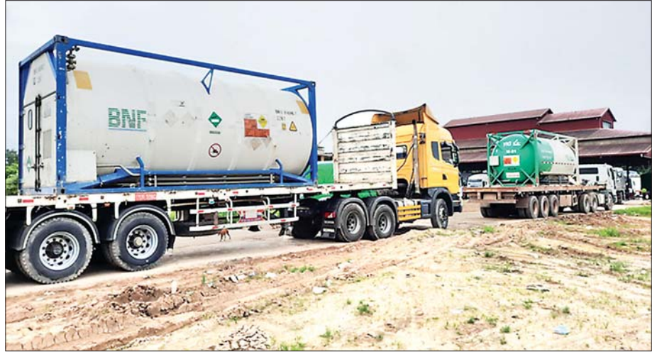
အောက်ဆီဂျင်အရည် (Bowser) ယာဉ်များ နယ်စပ်ဂိတ်များမှတစ်ဆင့် ပိတ်ရက်မရှိ တင်သွင်းခွင့်ပြုပေးနေမှုကို တွေ့ရစဉ်။

ဇူလိုင်လလယ်ခန့်မှစတင်၍ နေပြည်တော်ကောင်စီနယ်မြေနှင့် တိုင်းဒေသကြီး၊ ပြည်နယ်အသီးသီးရှိ မြို့များတွင် အောက်ဆီဂျင် Plant များ အမြန်ဆုံးတည်ဆောက် လည်ပတ်နိုင်ရေးအတွက် ကြိုးပမ်းလျက်ရှိသည်ကိုလည်း မြင်တွေ့ရပြီး မြို့နယ်အသီးသီးတွင် ကွာရန်တင်းစင်တာများ၊ ကိုဗစ်ကုသရေးနှင့် စောင့်ကြည့်ရေးစင်တာများကို ကြိုတင်ပြင်ဆင်ရေး၊ လူနာများလက်ခံကုသရေးတို့ကိုလည်း ဇူလိုင်လအတွင်း ဖွင့်လှစ်နိုင်ခဲ့ပြီး Mask ဖြန့်ဝေခြင်းမှသည် ကိုဗစ်သံသယလူနာများ စစ်ဆေးအတည်ပြုခြင်း၊ ကျန်းမာရေးစောင့်ရှောက်မှုကို မြို့နယ်၊ ရပ်ကွက်၊ ကျေးရွာအလိုက် အဆင့်ဆင့်