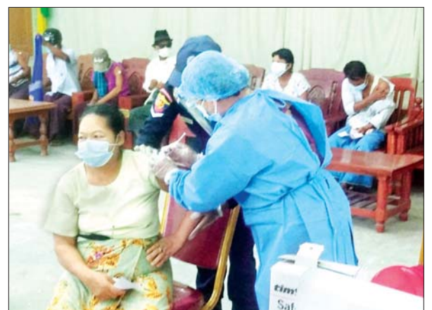
စစ်ကိုင်းတိုင်းဒေသကြီး မြောင်မြို့နယ်။