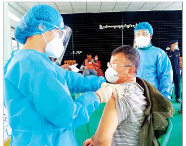
ချင်းပြည်နယ် တီးတိန်မြို့။