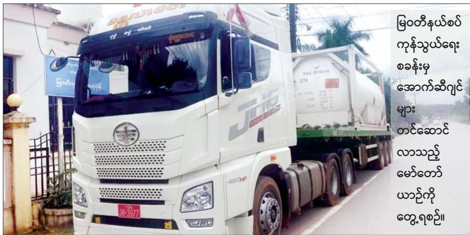
မြဝတီနယ်စပ် ကုန်သွယ်ရေး စခန်းမှ အောက်ဆီဂျင် များ တင်ဆောင် လာသည့် မော်တော် ယာဉ်ကို တွေ့ရစဉ်။

နေပြည်တော် ဩဂုတ် ၁၂ စီးပွားရေးနှင့်ကူးသန်းရောင်းဝယ်ရေးဝန်ကြီးဌာနအနေဖြင့် နိုင်ငံတော်အတွင်း၌ ကိုဗစ်-၁၉ ကာကွယ်၊ ထိန်းချုပ်၊ ကုသရေးလုပ်ငန်းများအတွက် အရေးတကြီးလိုအပ်လျက်ရှိသည့် အောက်ဆီဂျင်အရည်၊ အောက်ဆီဂျင်ဓာတ်ငွေ့၊ အိမ်သုံးအောက်ဆီဂျင်စက်နှင့် ဆေးဝါးနှင့်ဆက်စပ်ပစ္စည်းများ ပြတ်လပ်မှုမရှိ စေရန် အများပြည်သူ ရုံးပိတ်ရက်များတွင်လည်း လေကြောင်း၊ ရေကြောင်းနှင့် နယ်စပ်ကုန်သွယ်ရေးစခန်း များမှ စဉ်ဆက်မပြတ် တင်သွင်းနိုင်ရေးအတွက် စီစဉ်ဆောင်ရွက်ပေးလျက်ရှိသည်။ စာမျက်နှာ ၄ ကော်လံ ၁ *