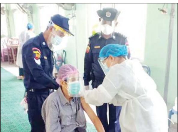
ရန်ကုန်တိုင်းဒေသကြီး ဒေါပုံမြို့နယ်။