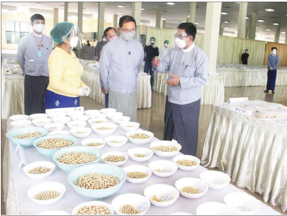
စစ်ဆေးကြည့်ရှုသည်။ (အပေါ်ပုံ) အတွင်း မြန်မာ့ပုလဲထုတ်လုပ်ရေး လျက်ရှိသော ပြည်ပကုမ္ပဏီ နှင့် ရောင်းဝယ်ရေးလုပ်ငန်းနှင့် လေးခု ပြည်တွင်းကုမ္ပဏီခုနစ်ခု နှင့် နိုင်ငံပိုင်ပုလဲစခန်းတစ်ခု၊ မြန်မာ့ပုလဲထုတ်လုပ်ရေး ဥပဒေပုဒ်မ

နေပြည်တော် ဩဂုတ် ၁၂ မြန်မာ့ပုလဲ ထုတ်လုပ်ရေးနှင့် ရောင်းဝယ်ရေး လုပ်ငန်းနှင့် အကျိုးတူဖက်စပ်ဆောင်ရွက် လျက်ရှိသော ပုလဲမွေးမြူထုတ်လုပ် ရေးကုမ္ပဏီ၏ ဖော်ယူပြီးသော ပုလဲများကို တနင်္သာရီတိုင်းဒေသ ကြီး မြိတ်မြို့မှ နေပြည်တော်သို့ မြန်မာ့လေကြောင်း စင်းလုံးငှား လေယာဉ်ဖြင့် သယ်ယူ၍ တန်ဖိုး ဖြတ်ခြင်းနှင့် အချိုးကျခွဲဝေခြင်း ကို ယနေ့ နံနက် ၁၀ နာရီတွင် နေပြည်တော် မြန်မာ့ကျောက်မျက် ရတနာပြတိုက်၌ ကိုဗစ်-၁၉ ကူးစက်ရောဂါကာကွယ်ထိန်းချုပ် ရေး စည်းမျဉ်းစည်းကမ်းများနှင့် အညီ ကျင်းပရာ သယံဇာတနှင့် သဘာဝပတ်ဝန်းကျင်ထိန်းသိမ်း ရေးဝန်ကြီးဌာန ပြည်ထောင်စု ဝန်ကြီးဦးခင်မောင်ရီတက်ရောက်