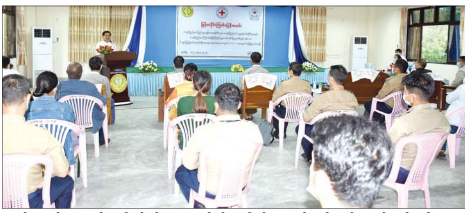
ရမည့်အချက်များ အပါအဝင် ကိုဗစ်-၁၉ ရောဂါနှင့် ပတ်သက်၍ သိသင့်သိထိုက်သည့် နောက်ဆုံးရ အချက်အလက်များ၊ ကိုဗစ်-၁၉ အတည်ပြုလူနာများ ပြုစုစောင့်ရှောက်ရာတွင် စနစ်တကျစီမံခန့်ခွဲ၍ ကြိုတင်ကာကွယ်ဆောင်ရွက်ရမည့် အချက်များကို ပြည်သူ့ကျန်းမာရေးဦးစီးဌာနရုံး သင်တန်းခန်းမ၌ ကိုဗစ်-၁၉ စည်းကမ်းချက်များနှင့်အညီ လူဦးရေ ၃၅ ဦး တက်ရောက်သည့်အပြင် အွန်လိုင်းမှ တက်ရောက် သူ ၇၀ ကျော်ဖြင့် ရက်သတ္တနှစ်ပတ်ကြာ ဖွင့်လှစ် သင်ကြားပေးမည်ဖြစ်ကြောင်း သိရသည်။ ပြည်နယ် (ပြန်/ဆက်)

တက်ရောက်ကြမည့် ကြက်ခြေနီတပ်ဖွဲ့ဝင်များ၊ ဘာသာရေးအဖွဲ့အစည်းများ၊ ပရဟိတအဖွဲ့အစည်း များနှင့် တိုင်းရင်းသားစာပေနှင့် ယဉ်ကျေးမှုအဖွဲ့တို့မှ စေတနာ့ဝန်ထမ်းများ တက်ရောက်ကြသည်။ အဆိုပါ သင်တန်းတွင် ကျန်းမာရေးဝန်ကြီးဌာန၊ လူမှုဝန်ထမ်း၊ ကယ်ဆယ်ရေးနှင့် ပြန်လည်နေရာချ ထားရေးဝန်ကြီးဌာနနှင့် မြန်မာနိုင်ငံဆရာဝန် အသင်းတို့မှ ပူးပေါင်းပြုစုထုတ်ဝေထားသည့် စေတနာ့ဝန်ထမ်းလက်စွဲစာအုပ်ပါ တုံ့ပြန်ဆောင်ရွက်