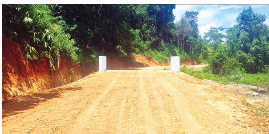
ခိုင်ထူး (ပြန်/ဆက်)

သစ်ပင်နည်းလာ၊ တို့ကမ္ဘာ လွန်စွာပူအေး၊ ဥတုဘေး