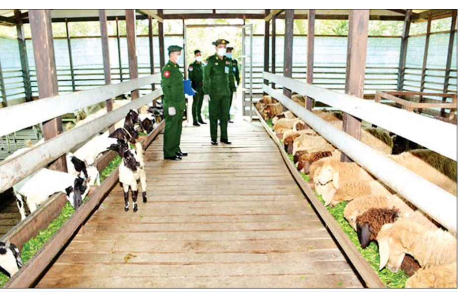
ကမ်းရိုးတန်းဒေသတိုင်းစစ်ဌာနချုပ် တိုင်းမှူး ဗိုလ်ချုပ် စောသန်းလှိုင်နှင့် တာဝန်ရှိသူများ မြိတ်တပ်နယ်၌ မွေးမြူရေးလုပ်ငန်း ဆောင်ရွက်ထားရှိမှုကို ကြည့်ရှုစစ်ဆေးစဉ်။

ဥစားကြက်မွေးမြူရေးခြံတို့ကို လည်းကောင်း၊ ရန်ကုန်တိုင်းဒေသကြီးဝန်ကြီးချုပ် ဦးလှစိုး၊ ရန်ကုန် တိုင်းစစ်ဌာနချုပ် တိုင်းမှူး ဗိုလ်ချုပ် ညွန့်ဝင်းဆွေနှင့် တာဝန်ရှိသူများသည် ဩဂုတ် ၁၁ ရက်တွင် တွဲတေး မြို့နယ် အရိုင်းတောင်ကျေးရွာအုပ်စု ဇောတိက ကျေးရွာရှိ Kyaw Lay Kyaw Company Limited ၏ ကျွဲ၊ နွားယာယီစုဆောင်းခြံနှင့် ရန်ကုန်ပေါက် ကျေးရွာအုပ်စုရှိ ရန်ကုန်မြို့တော်စည်ပင်သာယာ ရေးကော်မတီ၊ တွဲတေးစိုက်ပျိုးမွေးမြူရေးစခန်း၌ ငါးမွေးမြူထုတ်လုပ်မှုနှင့် ထူးသစ်ကုမ္ပဏီမှ ဧက ၃၅၀ ၌ ငါး၊ ပုစွန်မွေးမြူထုတ်လုပ်မှုများကိုလည်း ကောင်း အသီးသီးသွားရောက်ကြည့်ရှု၍ တာဝန် ရှိသူများနှင့်တွေ့ဆုံကာ ကုန်ထုတ်လုပ်မှုလုပ်ငန်းများ ရာနှုန်းပြည့်ဆောင်ရွက်နိုင်ရေး လိုအပ်သည်များ ပေါင်းစပ်ညှိနှိုင်းဆောင်ရွက်ပေးခဲ့ကြောင်း သတင်း ရရှိသည်။ သတင်းစဉ်