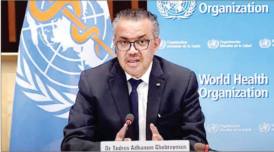
ကမ္ဘာ့ကျန်းမာရေးအဖွဲ့ ညွှန်ကြားရေးမှူးချုပ် တက်ဒရော့စ်အက်ဟာနွမ်ဂီဘရီယက်ဆစ်။

ဂျီနီဗာ ဩဂုတ် ၁၂ ကမ္ဘာ့ကျန်းမာရေးအဖွဲ့က ကိုဗစ်-၁၉ အတွက် ကာကွယ်ဆေးသစ် သုံးမျိုးကို စမ်းသပ်မည်ဖြစ်ကြောင်း၊ အဆိုပါစမ်းသပ်မှုတွင် နိုင်ငံပေါင်း ၅၅ နိုင်ငံရှိ ဆေးရုံပေါင်း ၆၀၀ ကျော်မှ သုတေသီ ထောင်ကျော် ပါဝင်မည်ဖြစ်ကြောင်း ဩဂုတ် ၁၁ ရက်က ကြေညာလိုက်သည်။ ကမ္ဘာ့ကျန်းမာရေး အဖွဲ့က ထုတ်ပြန်လိုက်သော ထုတ်ပြန်ချက်တွင် စမ်းသပ်မည့် ဆေးသစ် သုံးမျိုးမှာ ပြင်းထန်ငှက်ဖျားကို ကုသရန် အာတတ်ဆူနိုက်ဆေး၊ တီကျသေချာသော ကင်ဆာများ