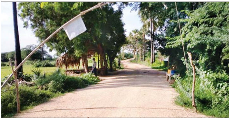
ပစ်ခတ်မှုဖြစ်ပွားသည့်နေရာ မှတ်တမ်းပုံ။