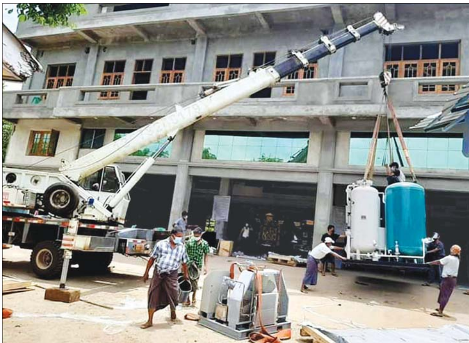
ကလည်း ၎င်းတို့အစီအစဉ်ဖြင့် သီးခြားအလှူငွေ ရှာဖွေ၍ ဝယ်ယူနိုင်ရေး ဆောင်ရွက်လျက်ရှိရာ အဆိုပါ အောက်ဆီဂျင်စက်ရုံအတွက် မြေနေရာကို စိတ္တပါလဂူကျောင်းစာသင်တိုက်အနီးတွင် ထားရှိ မည်ဖြစ်ပြီး မကြာမီလပိုင်း အတွင်းရောက်ရှိမည်ဖြစ်

ကျောက်ပန်းတောင်းမြို့နယ်အတွက် အောက်ဆီ ဂျင်လိုအပ်ချက် ဖြည့်ဆည်းဆောင်ရွက်ပေးသွားမည်ဖြစ် ကြောင်း သိရသည်။