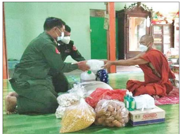
ဘုန်းတော်ကြီးကျောင်းများ၊ သီလရှင်ကျောင်းများနှင့် ဘာသာရေးကျောင်းများ၌ ဆွမ်း ဆန်တော် ဆီ၊ ဆား၊ ပဲ အမယ် လေးမျိုးနှင့် လှူဖွယ်ပစ္စည်းများဆက်ကပ်လှူဒါန်း

ယင်းသို့ ဆောင်ရွက်ပေးနေမှု များကို သက်ဆိုင်ရာ တိုင်းဒေသ ကြီးနှင့် ပြည်နယ် ဝန်ကြီးချုပ်များ၊ တိုင်းစစ်ဌာနချုပ်များမှ တိုင်းမှူး များနှင့် တာဝန်ရှိသူများက သွားရောက်ကြည့်ရှု အားပေးပြီး လိုအပ်သည်များ ညှိနှိုင်းဆောင် ရွက်ပေးကြကြောင်း သတင်း ရရှိသည်။ သတင်းစဉ်