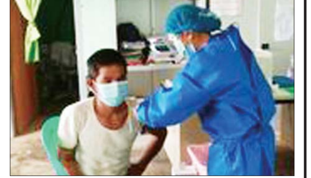
ကချင်ပြည်နယ် ဆွမ်ပရာဘွမ်မြို့နယ်။ မြို့နယ်(ပြန်/ဆက်)