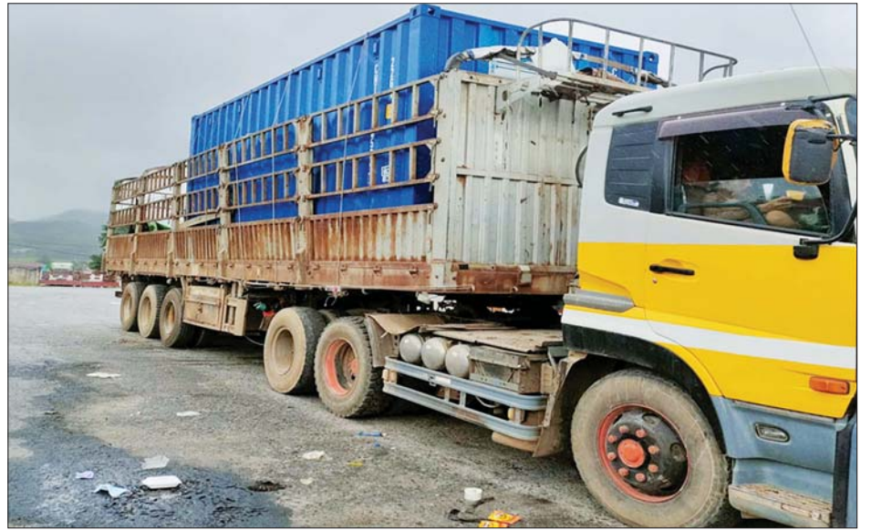
မူဆယ်နယ်စပ်ကုန်သွယ်ရေးစခန်းမှ အောက်ဆီဂျင်အရည်အိုးများနှင့် အောက်ဆီဂျင်အရည်များ တင်သွင်းလာစဉ်။