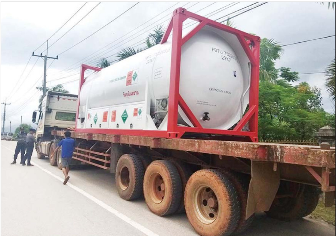
မြဝတီနယ်စပ်ကုန်သွယ်ရေးစခန်းမှ အောက်ဆီဂျင်အရည် တင်သွင်းလာသည့် မော်တော်ယာဉ်တစ်စီးကို တွေ့ရစဉ်။