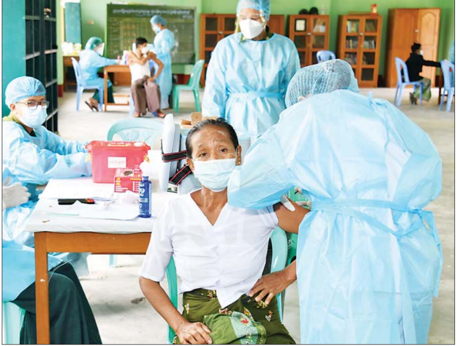
နေပြည်တော် ပုဗ္ဗသီရိမြို့နယ် အမှတ်(၂၀) အခြေခံပညာအထက်တန်းကျောင်း၌ ကိုဗစ်-၁၉ ရောဂါ ကာကွယ်ဆေး ထိုးနှံပေးစဉ်။

ရိုကန်နိုင်ငံ၏ ကူညီထောက်ပံ့မှုများကို ကျေးဇူးတင်ရှိကြောင်းနှင့် အာဆီယံပေါင်းစည်းရေး ဦးဆောင်ဦးရွက်ပြုမှုအစီအစဉ် (IAI) ကိုလည်း ဆက်လက်ကူညီပံ့ပိုးသွားရန် တိုက်တွန်းပြောကြားခဲ့သည်။ (၁၁)ကြိမ်မြောက် မဲခေါင် - ဂင်္ဂါ ပူးပေါင်းဆောင်ရွက်မှု နိုင်ငံခြားရေးဝန်ကြီးများ အစည်းအဝေးကို ဇူလိုင် ၂၁ ရက်က ဗီဒီယိုကွန်ဖရင့်ဖြင့် ကျင်းပခဲ့ရာ အပြည်ပြည်ဆိုင်ရာပူးပေါင်းဆောင်ရွက်ရေးဝန်ကြီးဌာန ပြည်ထောင်စုဝန်ကြီး တက်ရောက်ခဲ့ပြီး မြန်မာနိုင်ငံအနေဖြင့် မဲခေါင်-ဂင်္ဂါ ပူးပေါင်းဆောင်ရွက်မှု မူဘောင်အောက်၌ အပြည့်အဝ ပူးပေါင်းဆောင်ရွက်သွားမည်ဖြစ်ကြောင်း ထပ်လောင်းပြောကြားနိုင်ခဲ့ပါသည်။ (၅၄) ကြိမ်မြောက် အာဆီယံခရီးသွားလုပ်ငန်း အာဏာပိုင်အစည်းအဝေးနှင့် ဆက်စပ်အစည်းအဝေးများ၊ အရှေ့တောင်အာရှနိုင်ငံများဆိုင်ရာ စာရင်းစစ်ချုပ်ရုံးများအဖွဲ့ အဆင့်မြင့်အရာရှိအစည်းအဝေးများ၊ အာဆီယံ၏ (၂၁) ကြိမ်မြောက် နိုင်ငံဖြတ်ကျော်မှုခင်း တိုက်ဖျက်ရေးဆိုင်ရာ အဆင့်မြင့်အရာရှိကြီးများ အစည်းအဝေးစသည့် နိုင်ငံတကာအစည်းအဝေးများကိုလည်း သက်ဆိုင်ရာဝန်ကြီး