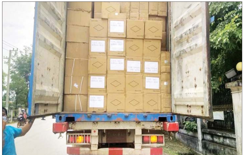
မြဝတီနယ်စပ်ကုန်သွယ်ရေးစခန်းမှ ကိုဗစ်-၁၉ ရောဂါ ကာကွယ်ရေးပစ္စည်းများ တင်သွင်းလာစဉ်။