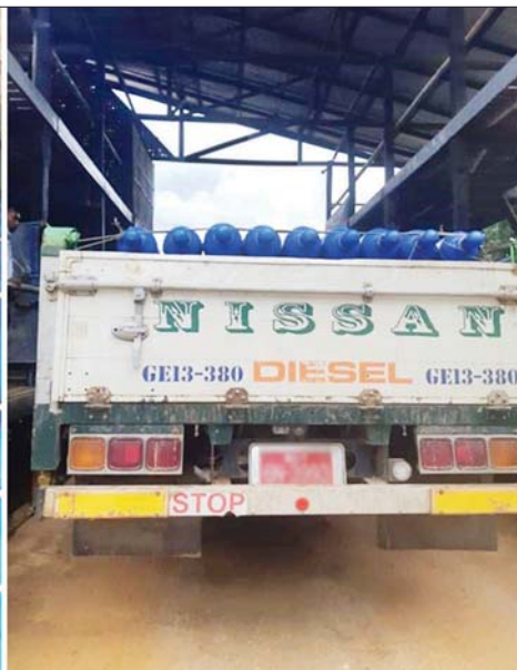
ချင်းရွှေဟော်နယ်စပ်ကုန်သွယ်ရေးစခန်းမှ အောက်ဆီဂျင်အရည်အိုးများ တင်သွင်းလာစဉ်။