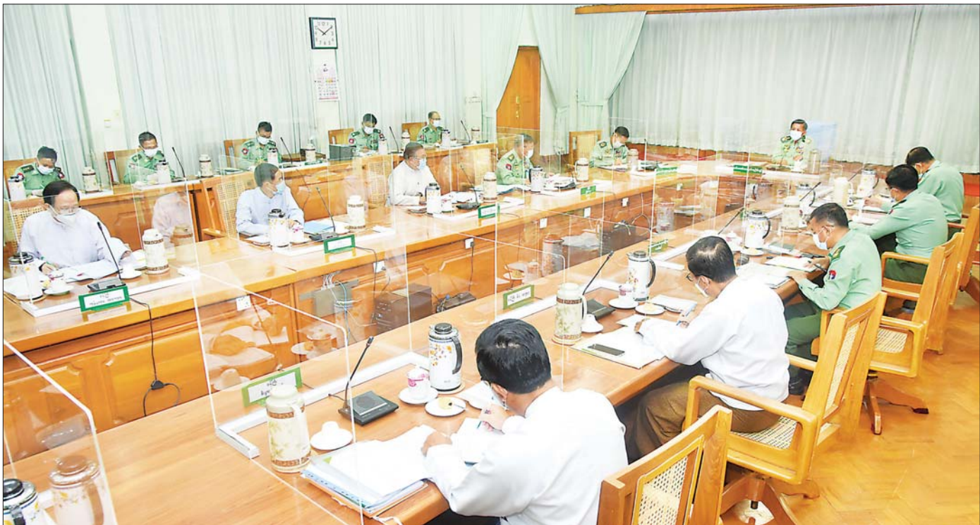
ဧူလိုင် ၁၂ ရက်က ကိုဗစ်-၁၉ ရောဂါ ကာကွယ်၊ ထိန်းချုပ်၊ ကုသရေးဆိုင်ရာ ဒုတိယအကြိမ် ညှိနှိုင်းအစည်းအဝေး ကျင်းပစဉ်။

CDM ကြောင့် ကျန်းမာရေးဝန်ထမ်းအင်အား နည်းပါးချိန် ရှိသမျှအင်အားကို စုစည်းကာ တပ်မတော်ဆေးဝန်ထမ်းတပ်ဖွဲ့၊ ပရဟိတစေတနာ ရှင် လုပ်အားရှင်များက ကိုဗစ် - ၁၉ ရောဂါကို ရှေ့တန်းမှ စုပေါင်းကာကွယ်ပေးလျက်ရှိကြသည်။ နိုင်ငံတော်ကလည်း ကိုဗစ်-၁၉ ကာကွယ်၊ ထိန်းချုပ်၊ ကုသရေးအတွက် ဧူလိုင်လတစ်လတည်းမှာပင် ညှိနှိုင်းအစည်းအဝေးပေါင်း ငါးကြိမ်နှင့် နိုင်ငံတကာ နှင့် ပူးပေါင်းဆောင်ရွက်နိုင်ရန် အစည်းအဝေး တစ်ကြိမ်တို့ဖြင့် အရေးကြီးသည့် မူဝါဒများ ချမှတ်ခြင်း၊ ချက်ချင်းအကောင်အထည်ဖော်ရန်နှင့် ဆုံးဖြတ်ချက်များချမှတ်ရန် ပွင့်လင်းမြင်သာစွာ ဆွေးနွေးတိုင်ပင်ခဲ့ကြသည်။ ရုံးများ၊ ကျောင်းများကို အချိန်မီပိတ်ထားလိုက်ခြင်း၊ အောက်ဆီဂျင်လိုအပ် ချက်ကို နည်းလမ်းပေါင်းစုံဖြင့် ဖြည့်တင်းပေးခြင်း၊ စောင့်ကြပ်ကြည့်ရှုခြင်း၊ ရောဂါကုသခြင်းစသည် တို့အတွက် ကွာရန်တင်းစင်တာများ၊ ကိုဗစ်စင်တာ များကို ရက်ပိုင်းအတွင်း အမြန်ဆုံးတိုးချဲ့ပွင့်လှစ် ခြင်း၊ ရောဂါထပ်မံကူးစက်ပြန့်ပွားမှုကို ထိန်းချုပ် နိုင်မည့် အရေးကြီးဆုံး လုပ်ဆောင်ချက်ဖြစ်သည့် ပြည်သူ့လူထုကို ကာကွယ်ဆေး အမြန်ဆုံးထိုးနှံ လွှမ်းခြုံနိုင်ရေး စသည့်လုပ်ဆောင်ချက်များကို တစ်လတာအတွင်း အင်တိုက်အားတိုက်