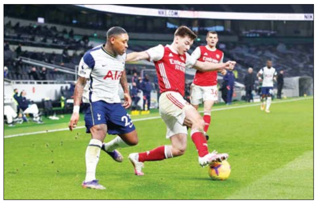
ရာသီအကြို ခြေစမ်းပွဲအဖြစ် စပါးအသင်းနှင့် အာဆင်နယ်အသင်းတို့ ယှဉ်ပြိုင်ကစားစဉ်။

ထို့ပြင် အာဆင်နယ်အသင်းသည် လာမည့်ပွဲစဉ်များတွင် ချယ်ဆီး၊ မန်စီးစီးစသည့် အသင်းကြီးများနှင့် ဆက်တိုက်ရင်ဆိုင် ကစားရဖွယ်ရှိနေသောကြောင့် ယနေ့ပွဲစဉ်ကို အနိုင်ရရှိအောင် အားစိုက် ကစားလာဖွယ်ရှိသည်။ ဘရန့်ဖိုဒီအသင်းက ယနေ့ပွဲစဉ်ပြီးလျှင် အာဆင်နယ်အသင်းကဲ့သို့ အသင်းကြီးများနှင့် ဆက်တိုက်ရင်ဆိုင် ကစားရဖွယ်မရှိသော်လည်း အဖွင့်ပွဲစဉ်တွင် ရလဒ်ကောင်းရရှိရန်အတွက် အသင်းကို အကောင်းဆုံးပြင်ဆင်လာဖွယ်ရှိနေသည်။ အဆိုပါ နှစ်သင်း