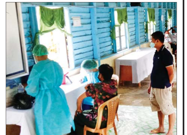
ချင်းပြည်နယ် ရဲခေါင်မြို့။ ပက်ကာ