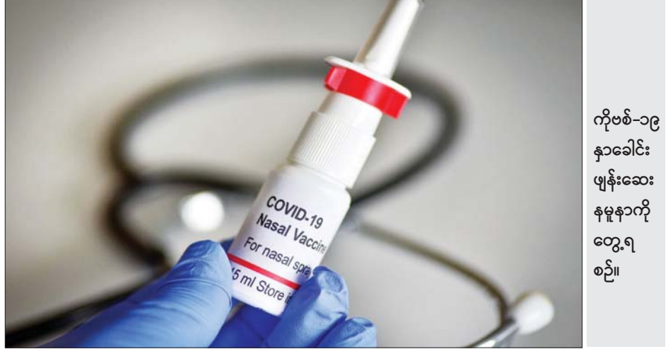
ကိုဗစ်-၁၉ နှာခေါင်းဖျန်းဆေး နမူနာကို တွေ့ရ စဉ်။

ဩဂုတ် ၁၁ ရက်အထိ လူပေါင်းအနည်းဆုံး ၂၅ ဒသမ ၇၂ သန်း ကိုဗစ်-၁၉ ကာကွယ်ဆေးနှစ်ကြိမ် ထိုးနှံပြီးပြီဖြစ်ကြောင်း သိရပြီး ကိုဗစ်-၁၉ ကာကွယ်ဆေးတစ်ကြိမ် ထိုးနှံပြီးသူပေါင်း ၅၂ ဒသမ ၂၈ သန်းရှိကြောင်း ကျန်းမာရေးဝန်ကြီးဌာနက သတင်းထုတ်ပြန် ကြေညာလိုက်သည်။ ဆင်ဟွာ