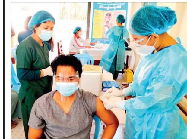
မကွေးတိုင်းဒေသကြီး ပေါက်မြို့နယ်။ ဉာဏ်တိုး