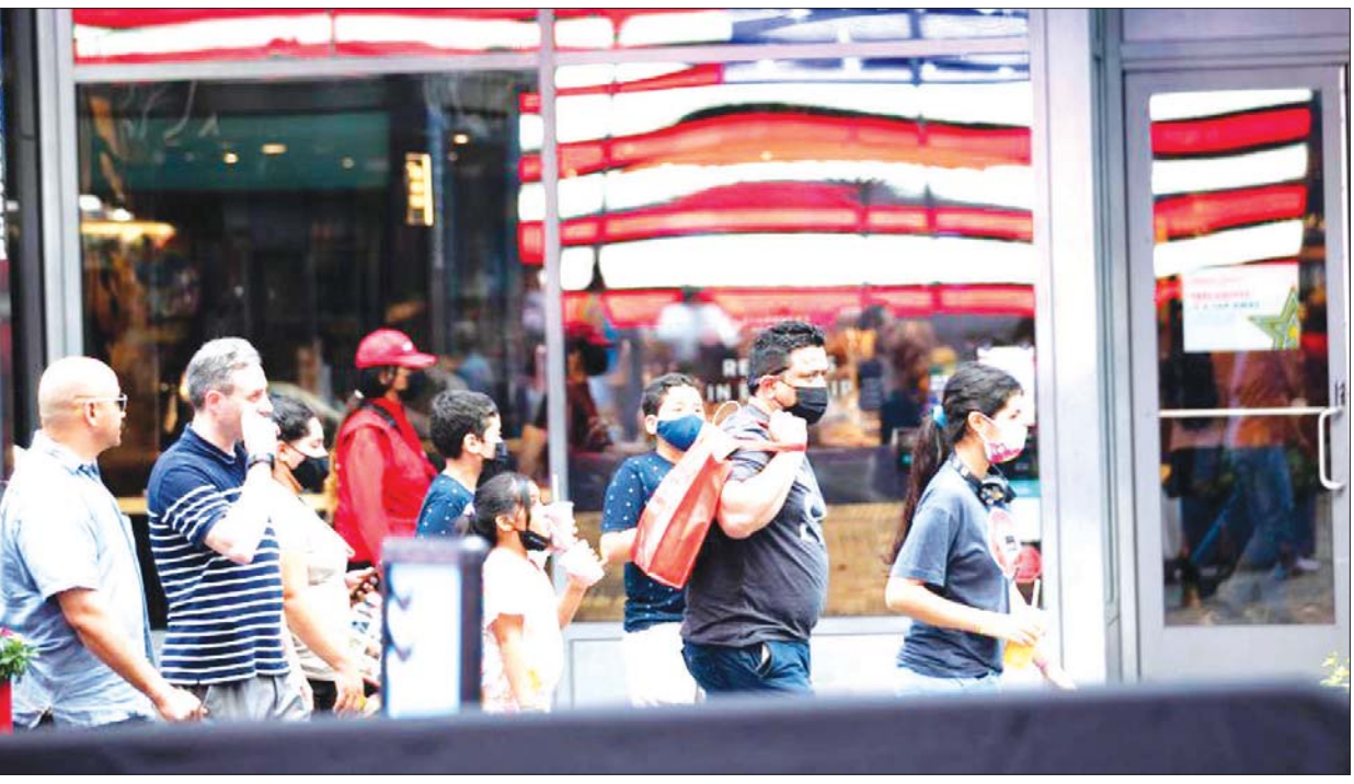
နယူးယောက်မြို့တိုင်းမိစကွဲယားတွင် သွားလာနေကြသူများကို တွေ့ရစဉ်။

ဩဂုတ် ၁၀ ရက် ညနေ ၆ နာရီ ၂၁ မိနစ်တွင် အမေရိကန်နိုင်ငံ၏ ကိုဗစ်- ၁၉ ကူးစက်မှုနှုန်းမှာ ၃၆၀၃၉၇၄၈ ဦး ရှိခဲ့သည်။ သေဆုံးသူ မှာလည်း ၆၁၈၀၄၄ ဦး ရှိခဲ့သည်ဟု ဂျွန်ဟော့ကင်းတက္ကသိုလ်၏ တွက်ချက်မှုအရ သိရသည်။ အမေရိကန်တွင် ဖြစ်ပွားနေသည့် ကိုဗစ်- ၁၉ ကူးစက်မှုများမှာ တစ်ဖွဲ့လုံးဆိုင်ရာ ကူးစက်မှု၏ ၁၈ ရာခိုင်နှုန်း ရှိပြီး ကိုဗစ်-၁၉ နှင့်ဆက်စပ်ပြီး သေဆုံးမှုနှုန်းမှာလည်း တစ်ကမ္ဘာလုံး အနှံ့နှိုင်းယှဉ်ကြည့်လျှင်၁၄ ရာခိုင်နှုန်းရှိသည်ဟု စာရင်းအင်း အချက် အလက်များက ဖော်ပြလျက်ရှိသည်။ အမေရိကန်တွင် လူဦးရေ အချိုးအတိုင်း ကာကွယ်ဆေးအပြည့်ထိုးမှုမလုပ်နိုင်ပါက တစ်နေ့လျှင် လူပေါင်း နှစ်သိန်းအထိ ကူးစက်မှုနှင့် ကြုံတွေ့လာနိုင်ဖွယ်ရှိသည်ဟု ဓာတ်မတည့်မှုနှင့် ကူးစက်ရောဂါ အမျိုးသားအင်စတီကျုမှ အကြီး အကဲဖြစ်သူ အန်သိုနီဖောင်စီက သတိပေးပြောကြားခဲ့သည်။