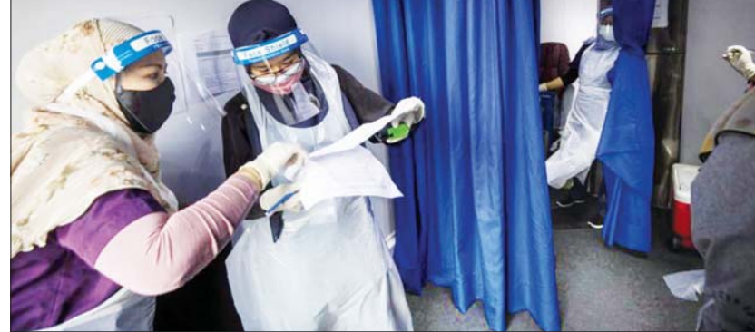
မလေးရှားနိုင်ငံရှိ ကျန်းမာရေးဝန်ထမ်းများ ကိုဗစ်-၁၉ အထောက်အထားများကို ကြည့်ရှုနေစဉ်။

ကျန်ရှိနေသော ကိုဗစ်-၁၉ ကူးစက် ဖြစ်ပွားလျက်ရှိသူ ၂၃၃၃၅၈ ဦးရှိသည့်အနက် ၁၀၅၃ ဦးမှာ အထူးကြပ်မက်ကုသဆောင် တွင် ဆေးကုသမှုခံယူလျက်ရှိပြီး ၅၄၆ ဦးမှာ အသက်ရှူအထောက်အကူပြု ကိရိယာလိုအပ် လျက်ရှိကြောင်း သိရသည်။ ဆင်ဟွာ