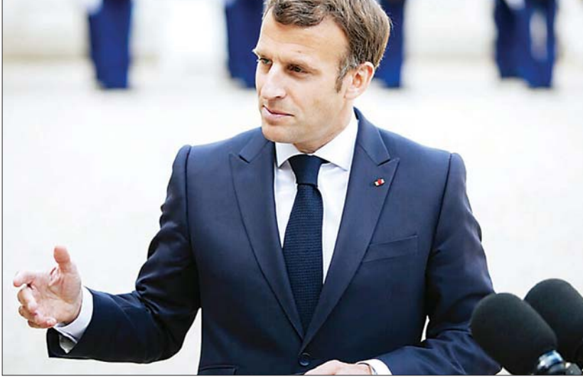
ပြင်သစ်သမ္မတ အီမန်ရှူးရယ်မက်ရွန်။

ပါရီ ဩဂုတ် ၆ ပြင်သစ်နိုင်ငံ၌ ထိခိုက်ခံစားလွယ်သည့် ပြည်သူများကို စက်တင်ဘာလတွင် တတိယ အကြိမ် ကိုဗစ် -၁၉ ကာကွယ်ဆေး ထိုးပေးနိုင်ရေးအတွက် ပြင်ဆင်မှုများပြုလုပ် နေသည်ဟု ပြင်သစ်သမ္မတ အီမန်ရှူးရယ် မက်ရွန်က ပြောသည်။ ဩဂုတ် ၅ ရက်တွင် ပြင်သစ်သမ္မတ အီမန်ရှူးရယ်မက်ရွန်သည် ၎င်း၏အင်စတာ ဂရမ်တွင် ဗီဒီယိုတစ်ခုတင်ခဲ့သည်။ လူငယ်များ ကိုဗစ် -၁၉ ကာကွယ်ဆေးထိုးရန်နှင့်ပတ်သက် သည့် မေးခွန်းများကို ဖြေကြားသည့် ဗီဒီယို ကို တင်ခဲ့ခြင်းဖြစ်သည်။ လူတိုင်း လူတိုင်း အတွက် တတိယအကြိမ်ကိုဗစ် -၁၉ ကာကွယ် ဆေး ချက်ချင်းထိုးရန်မလိုအပ်ကြောင်းနှင့် သက်ကြီးရွယ်အိုများနှင့် ထိခိုက်လွယ်သည့် လူများတွင်သာ လိုအပ်မှုရှိမည်ဟု မက်ရွန်က ပြောသည်။ အစွဲရေးနိုင်ငံအတွင်း အသက် ၆၀ နှင့် အထက်လူများကို တတိယအကြိမ် ကိုဗစ် -၁၉ ကာကွယ်ဆေးထိုးပေးမှု ပြုလုပ်ခဲ့သည်။ ဗြိတိန်နိုင်ငံနှင့် ဂျာမနီနိုင်ငံတို့တွင်လည်း လာမည့်လအတွင်း တတိယအကြိမ် ကိုဗစ်-၁၉