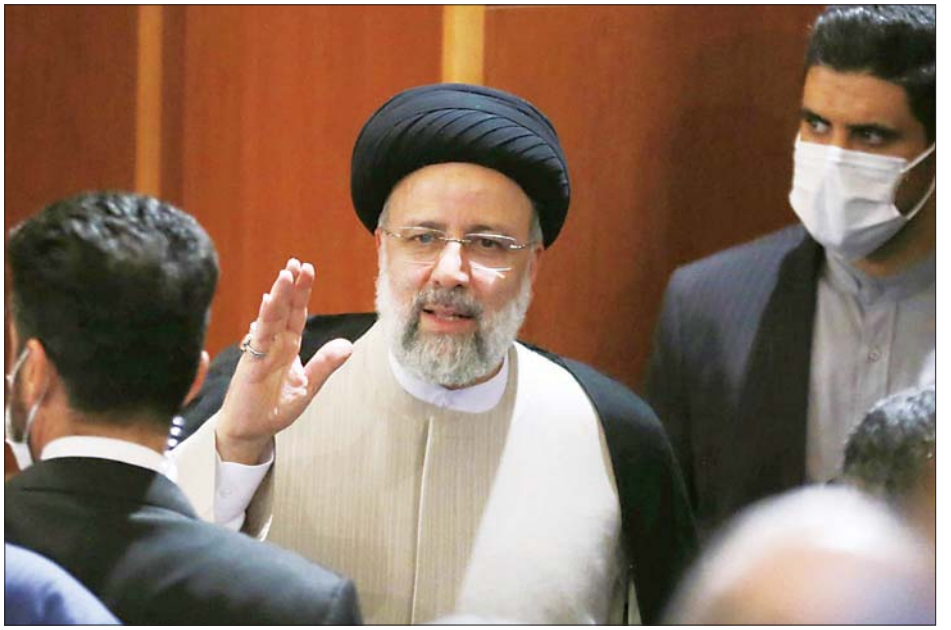
အီရန်သမ္မတ အီဘရာဟင်ရိုင်စီကို ဇွန် ၂၁ ရက်က ပြုလုပ်သည့် သတင်းစာရှင်းလင်းပွဲတွင် တွေ့ရစဉ်။

များသည် ဝင်ငွေကောင်းမွန်ရန်နှင့် လူနေမှုအဆင့် အတန်း မြင့်မားလိုကြသည်ဟုလည်း ၎င်းက ဆက်လက်ပြောကြားသည်။ အမေရိကန်၏ ပိတ်ဆို့မှုများအောက်တွင် တိုင်းပြည်စီးပွားရေးမှာ ရပ်တန့်နေပြီး ပြည်သူများ လိုလားချက်အတိုင်း ရရှိသွားအောင် ကြိုးပမ်းသွား မည်ဟု ၎င်းက ပြောသည်။ အီရန်အပေါ် ပိတ်ဆို့မှု များမှာ ဖယ်ရှားပေးရမည်ဖြစ်ပြီး ရည်မှန်းချက် အတိုင်း ဖြစ်မြောက်အောင် လုပ်ဆောင်ပေးမည့် မည်သည့်သံတမန်နည်းလမ်းမျိုးကိုမဆို ထောက်ခံ သွားမည်ဟု ၎င်းကဆက်ပြောသည်။ အီရန်နှင့် အမေရိကန်တို့သည် ၂၀၁၅ ခုနှစ် နှစ်ကျိတ်အရပ်အရပ်တွင် ပြန်လည်ဆက်သွယ်မှု ဆက်လက်ရင်သန် စေရေးအတွက် သွယ်ဝိုက်သော ဆွေးနွေးပွဲများ ပြုလုပ်လျက်ရှိသည်။ အင်န်အိတ်ချ်ကေ