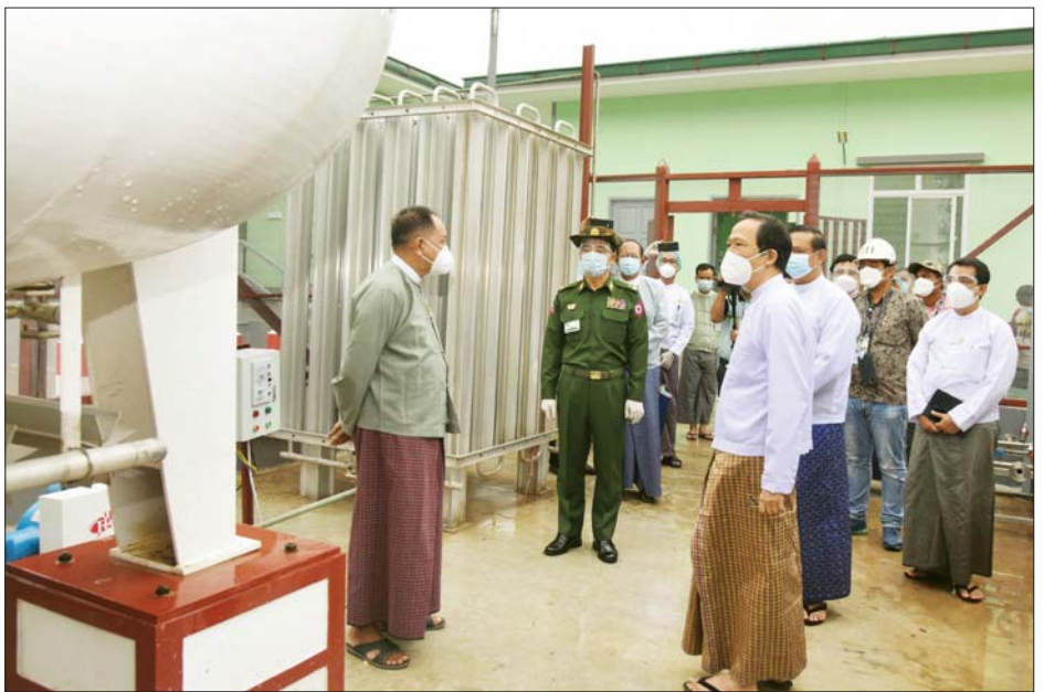
ပြည်ထောင်စုဝန်ကြီး ဒေါက်တာသက်ခိုင်ဝင်းနှင့် ဦးရွှေလေးတို့ အောက်ဆီဂျင်ထုတ်လုပ်သည့် စက်ရုံအတွင်း ကြည့်ရှုစစ်ဆေးစဉ်။

မှာကြားသည်။ ယနေ့ စတင်ဖွင့်လှစ်သည့် အောက်ဆီဂျင် ထုတ်လုပ်သည့်စက်ရုံ (Liquid Oxygen Plant) (နေပြည်တော်)သည် မြေအကျယ်အဝန်း အလျား ၁၀၂ ပေ၊ အနံ ၆၆ ပေပေါ်တွင် တည်ဆောက်ထားသည့် Steel Structure အမျိုးအစားဖြစ်ပြီး အောက်ဆီဂျင်ဖြည့်စင်၊ ရုံးခန်းနှင့် သိုလှောင်ခန်းတို့ ပါဝင်သည့် အဆောက်အအုံနှစ်လုံးပါဝင်ကာ ၁၀ မိနစ်