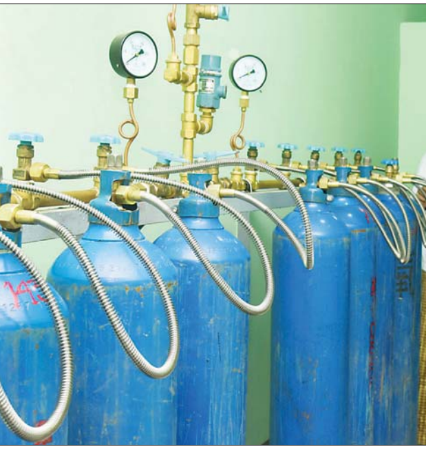
ပုဗ္ဗသီရိမြို့နယ် နေပြည်တော် ပြည်သူ့ဆေးရုံကြီး ခုတင်(၃၀၀)ဝင်းအတွင်း ဖွင့်လှစ်လိုက်သည့် အောက်ဆီဂျင်ထုတ်လုပ်သည့် စက်ရုံကို တွေ့ရစဉ်။

နေပြည်တော် ဩဂုတ် ၆ နေပြည်တော် ပုဗ္ဗသီရိမြို့နယ် တပင်ရွှေထီး ရပ်ကွက်ရှိ နေပြည်တော် ပြည်သူ့ဆေးရုံကြီး ခုတင် (၃၀၀) ဝင်းအတွင်း တည်ဆောက်ထားသည့် ကျန်းမာရေးဝန်ကြီးဌာန၊ ကုသရေးဦးစီးဌာန အောက်ဆီဂျင်ထုတ်လုပ်သည့် စက်ရုံ (Liquid Oxygen Plant) (နေပြည်တော်)ကို ယနေ့နံနက်ပိုင်းတွင် စတင်ဖွင့်လှစ်သည်။ ကျန်းမာရေးဝန်ကြီးဌာန ပြည်ထောင်စုဝန်ကြီးဒေါက်တာသက်ဝင်း၊ ဆောက်လုပ်ရေးဝန်ကြီးဌာန ပြည်ထောင်စုဝန်ကြီး ဦးရွှေလေး၊ နေပြည်တော်တိုင်းစစ်ဌာနချုပ် တိုင်းမှူး ဗိုလ်ချုပ် ဇော်မျိုးတင်၊ နေပြည်တော်ကောင်စီဝင် ဗိုလ်မှူးကြီး မင်းနောင်နှင့် တာဝန်ရှိသူများသည် နံနက် ၁၀ နာရီတွင် ယနေ့စတင်ဖွင့်လှစ်သည့် အောက်ဆီဂျင်ထုတ်လုပ်သည့် စက်ရုံသို့ ရောက်ရှိကြပြီး စက်ရုံအတွင်း အောက်ဆီဂျင်ထုတ်လုပ်နေမှု အခြေအနေကို လှည့်လည်ကြည့်ရှုစစ်ဆေးရာ ဆေးရုံအုပ်ကြီး ဒေါက်တာ သီတာစိုးနှင့် တာဝန်ရှိသူများက အောက်ဆီဂျင်ထုတ်လုပ်မှုအဆင့်ဆင့်၊ ထုတ်လုပ်နိုင်မှုနှင့် ဖြန့်ဖြူးသွားမည့် အခြေအနေများကို လိုက်လံရှင်းလင်းပြသကြသည်။ စာမျက်နှာ ၄ ကော်လံ ၁