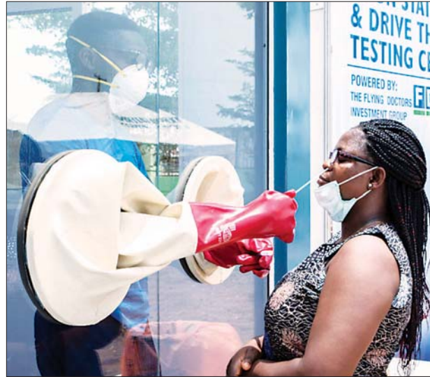
အာဖရိက၌ ကိုဗစ်-၁၉ စမ်းသပ်စစ်ဆေးပေးနေသည့်ကို တွေ့ရစဉ်။