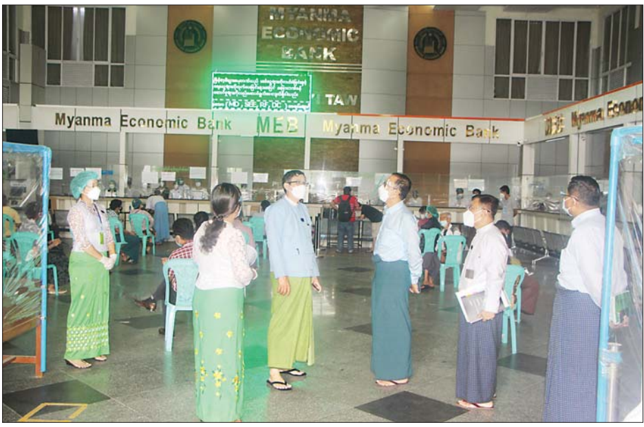
ထိုပြင်ဘဏ်နှင့်ဆက်သွယ်သူ အပ်ငွေအမျိုးမျိုးကို လက်ခံခြင်း နှင့် ချေးငွေအမျိုးမျိုးကို ထုတ်ချေးခြင်း၊ ပြည်တွင်း၊ ပြည်ပ ငွေ၊ အချိန်ပိုင်းအပ်ငွေ စသည့် ပြည်သူများ၏ ငွေစုဘဏ်အပ်ငွေ၊ စာရင်းရှင်အပ်ငွေ၊ စာရင်းသေအပ် ငွေ၊ အချိန်ပိုင်းအပ်ငွေ စသည့် ပြည်သူများအား ငွေထုတ်မှုများကို ကိုဗစ်-၁၉ ကာကွယ်၊ ထိန်းချုပ် ရေး လမ်းညွှန်ချက်များနှင့်အညီ

မြန်မာ့ စီးပွားရေးဘဏ် (နေပြည်တော်)သည် ဝန်ကြီးဌာန၊ ဦးစီးဌာနနှင့် တပ်ရင်း တပ်ဖွဲ့များ သို့ လစာထုတ်ပေးမှုနှင့် အသုံး စရိတ်များ ထုတ်ပေးနေမှုများကို ကိုဗစ်-၁၉ ရောဂါစတင်ဖြစ်ပွား သည့်အချိန်မှစ၍ သီးခြား ကောင်တာများဖွင့်လှစ်၍ ဆောင် ရွက်ပေးလျက်ရှိသည်။