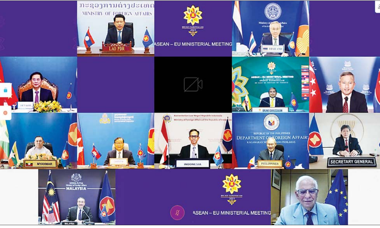
ပြည်ထောင်စုဝန်ကြီး ဦးဝဏ္ဏမောင်လွင် အာဆီယံ-အီးယူ နိုင်ငံခြားရေးဝန်ကြီးများ အစည်းအဝေးသို့ ပါဝင်တက်ရောက်စဉ်။

ဒေသတွင်းနှင့် နိုင်ငံတကာရေးရာကိစ္စရပ်များကို ဆွေးနွေးရာ၌ ပြည်ထောင်စုဝန်ကြီးက အာဆီယံဥက္ကဋ္ဌ၏ အထူးကိုယ်စားလှယ်အဖြစ် ခန့်အပ်ခဲ့သည့် အခြေအနေနှင့် ဥရောပသမဂ္ဂ သို့မဟုတ် နိုင်ငံအသီးသီး ၏ ပံ့ပိုးမှုများသည် အာဆီယံသဘောတူညီချက် (၅) ချက်နှင့် ရှေ့လုပ်ငန်းစဉ် (၅) ရပ်တို့ကို အထောက်အကူဖြစ်စေရန် အလေးပေး ပြောကြားခဲ့ပြီး ယင်းတို့ထက် ကျော်လွန်ဆောင်ရွက်မှုများသည် အာဆီယံဥက္ကဋ္ဌ၏ အထူးကိုယ်စားလှယ်နှင့် မြန်မာနိုင်ငံတို့အတွက် အကူအညီဖြစ်မည် မဟုတ်ကြောင်း အသိပေးပြောကြားသည်။ မြန်မာ နိုင်ငံအနေဖြင့် အထူးကိုယ်စားလှယ်ခန့်အပ်ခြင်းနှင့် စပ်လျဉ်း၍ အီးယူ