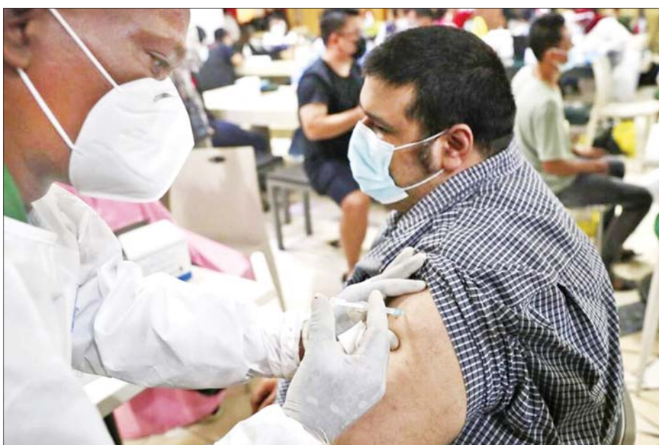
အင်ဒိုနီးရှား နိုင်ငံ၌ ကိုဗစ်-၁၉ ကာကွယ်ဆေးထိုးနှံပေးနေသည့်ကိုတွေ့ရစဉ်။

အင်ဒိုနီးရှားနိုင်ငံသည် လူပေါင်း ၂၀၈ ဒသမ ၂၁ သန်းအား ကာကွယ်ဆေးထိုးပေးနိုင်ရန် ရည်မှန်း ထားကြောင်း သိရသည်။