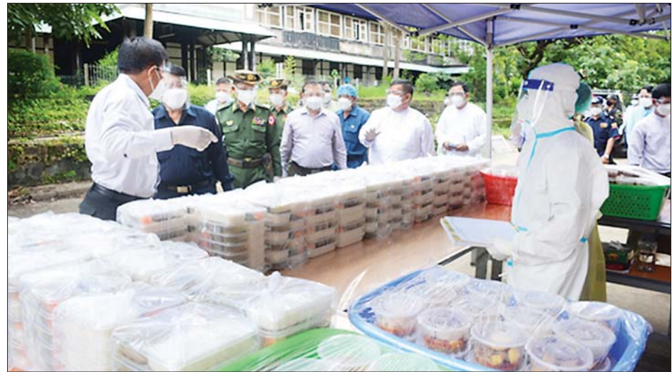
ရန်ကုန်တိုင်းဒေသကြီးဝန်ကြီးချုပ် ဦးလှစိုး၊ ရန်ကုန်တိုင်းစစ်ဌာနချုပ် တိုင်းမှူး ဗိုလ်ချုပ်ညွှန်ဝင်းဆွေတို့ ကိုဗစ်-၁၉ ရောဂါ အတည်ပြုလူနာများအတွက် အာဟာရဖြည့်စားသောက်ဖွယ်ရာများ ပြင်ဆင်ထားမှုကို ကြည့်ရှုစစ်ဆေးစဉ်။

အလားတူ ကိုဗစ်-၁၉ ရောဂါ ဓာတ်ခွဲအတည်ပြုပိုးတွေ့ ရဟန်း၊ သံဃာတော်များကို ရန်ကုန်တိုင်းဒေသကြီး မရမ်းကုန်းမြို့နယ် ကမ္ဘာအေး ဗုဒ္ဓသာသနာ့သံဃာ့ဆေးရုံတွင် ဇူလိုင် ၂၆ ရက်နေ့မှစ၍ ကုသပေးလျက်ရှိရာ ယနေ့အချိန်ထိ ၁၄ ပါး တက်ရောက် ကုသခဲ့ပြီး နှစ်ပါး ပြန်လည်ကောင်းမွန်ခဲ့သည်။ ကျန်းမာရေးစောင့်ရှောက်မှုနှင့် အမျိုးသမီး ၅၂ ဦး စုစုပေါင်း အနေဖြင့် ဆရာဝန် ခြောက်ဦး၊