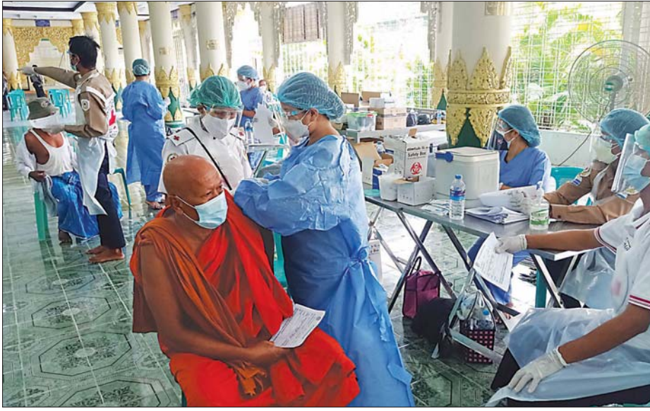
ရန်ကုန်တိုင်းဒေသကြီး တောင်ပိုင်းခရိုင် ခရမ်းမြို့နယ်တွင် သံဃာတော်များ အသက် ၆၅ နှစ်နှင့် အထက် သက်ကြီးဘိုးဘွားများအား ကိုဗစ်-၁၉ ကာကွယ်ဆေးထိုးနှံပေးစဉ်။

ဒါအပြင် ကိုဗစ် - ၁၉ ရဲ့ ရောဂါလက္ခဏာတွေ ခံစားရတဲ့အချိန်ကာလကလည်း တိုသွားပါတယ်။ ဆေးမထိုးထားတဲ့သူမှာ ရောဂါလက္ခဏာရဲ့ အချိန် ကာလကြာမှုက ၁၆ ဒသမ ၇ ရက် ကြာပေမယ့် ဆေးထိုးထားသူမှာ ၁၀ ဒသမ ၃ ရက်ပဲ ကြာတဲ့ အတွက် ရောဂါလက္ခဏာ ခံစားရချိန်တိုသွားပါ တယ်။ ဒါတွေက ကျန်းမာရေးဝန်ထမ်းတွေမှာ