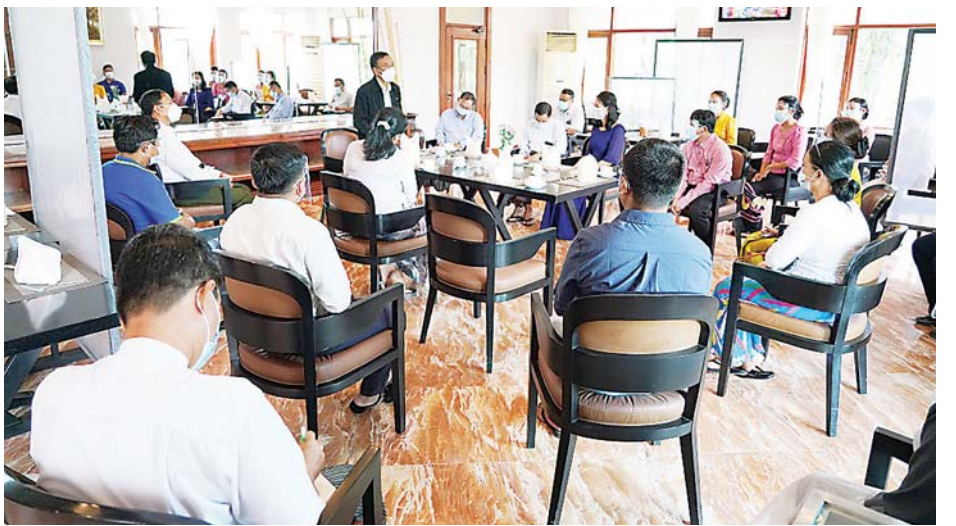
မန်နေဂျာများ၊ မန်နေဂျာနှင့် များကို သက်ဆိုင်ရာ ကဏ္ဍ သည်များကို ပြန်လည်ဆွေးနွေး ဝန်ထမ်းများက လုပ်ငန်း အလိုက် ရှင်းလင်းတင်ပြရာ ပြည်ထောင်စုဝန်ကြီးက လိုအပ် သည်။

အကြိမ်ကြိမ် ပြန်လည်တည်းခို လာရောက်နိုင်ရေးအတွက် မိမိ အနေဖြင့်လည်း လိုအပ်သည်များ ကို ပံ့ပိုးကူညီ ဆောင်ရွက်ပေး ရန်လိုအပ်ကြောင်းနှင့် အထူး သဖြင့် ကျန်းမာရေးနှင့် ဘေး အန္တရာယ်ကင်းရှင်းရေးကို ဂရုပြု ဆောင်ရွက်သွားရန် လိုအပ် ကြောင်း၊ လုပ်ငန်းများ ဆောင်ရွက် ရာတွင် အစိုးနှင့်ပုဂ္ဂလိက ထို့နောက် တွေ့ဆုံပွဲသို့ တက်ရောက် လာကြသည့် ကြိုးပမ်း ဆောင်ရွက်သွားရန် ဟိုတယ်များမှ အထွေထွေ