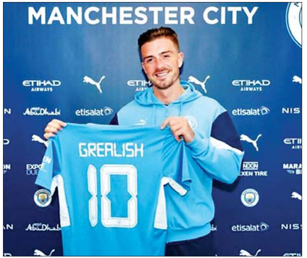
ဂရီးလစ်ချ်ကို မန်စီးတီးအသင်း ဂျာစီနှင့်အတူ တွေ့ရစဉ်။