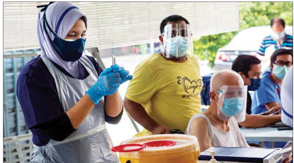
မလေးရှားနိုင်ငံ၌ သက်ကြီးရွယ်အိုတစ်ဦးအား ကိုဗစ်-၁၉ ကာကွယ်ဆေးထိုးပေးရန် ပြင်ဆင်နေသည့်ကို တွေ့ရစဉ်။

ကိုဗစ်-၁၉ ကြောင့်ထပ်မံသေဆုံးသူ ၁၉ ဦးရှိလာ ပြီးနောက် စုစုပေါင်းကိုဗစ်-၁၉ ကြောင့်သေဆုံးသူ ၁၅၆ ဦးအထိ ရောက်ရှိလာခဲ့ကာ ကိုဗစ်-၁၉ မှ ပြန်လည်ကောင်းမွန်လာသူ ၇၄၀၄၅ ဦးရှိလာပြီ ဖြစ်သည်။ ဆင်ဟွာ