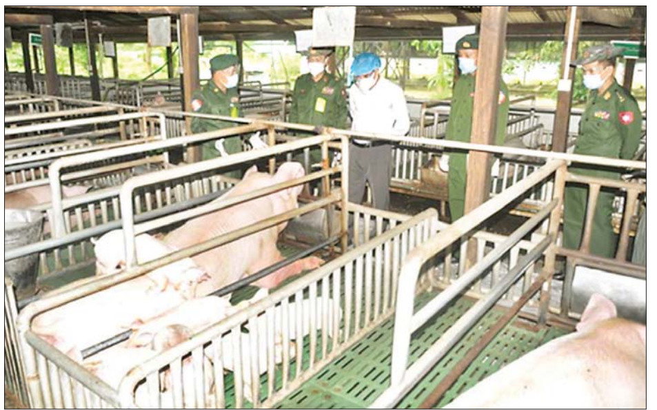
ပဲခူးတိုင်းဒေသကြီး ဝန်ကြီးချုပ် ဦးမျိုးဆွေဝင်း၊ တောင်ပိုင်းတိုင်းစစ်ဌာနချုပ် တိုင်းမှူး ဗိုလ်မှူးချုပ် ထိန်ဝင်းနှင့် တာဝန်ရှိသူများ နယ်မြေခံတပ်ရှိ DYL ဝက်မွေးမြူရေးလုပ်ငန်းကို ကြည့်ရှုစစ်ဆေးစဉ်။

လည်းကောင်း၊ တနင်္သာရီတိုင်းဒေသကြီး ဝန်ကြီးချုပ် ဦးမြတ်ကို၊ ကမ်းရိုးတန်းဒေသ တိုင်းစစ်ဌာနချုပ် ဒုတိယတိုင်းမှူး ဗိုလ်မှူးချုပ် သစ်လွင်ထူးနှင့် တာဝန်ရှိသူများက ထားဝယ်မြို့ရှိ တပ်နယ်စိုက်ပျိုး၊ မွေးမြူရေးစခန်းသို့လည်းကောင်း၊ ရန်ကုန်တိုင်းဒေသကြီး ဝန်ကြီးချုပ် ဦးလှစိုး၊ တိုင်းမှူး ဗိုလ်ချုပ် ညွန့်ဝင်းဆွေ နှင့် တာဝန်ရှိသူများက မင်္ဂလာဒုံမြို့နယ်ရှိ အမှတ်(၄) စိုက်ပျိုး၊ မွေးမြူရေးစခန်း၊ လေးထောင့်ကန်ရပ်ကွက်ရှိ ပုဂ္ဂလိကပိုင် အားမာန်စားနွားခြံနှင့် မှော်ဘီမြို့နယ်ရှိ တိုင်းစစ်ဌာနချုပ် ဘက်စုံစိုက်ပျိုး၊ မွေးမြူရေးစခန်း (ဝါးနက်ချောင်း)များသို့ လည်းကောင်း။ ဧရာဝတီတိုင်းဒေသကြီး ဝန်ကြီးချုပ် ဦးတင် မောင်ဝင်း၊ အနောက်တောင်တိုင်းစစ်ဌာနချုပ် တိုင်းမှူး ဗိုလ်ချုပ် အောင်အောင်နှင့် တာဝန်ရှိသူ များက တိုင်းစစ်ဌာနချုပ်ရှိ ဘက်စုံစိုက်ပျိုးမွေးမြူ ရေးခြံနှင့် နယ်မြေခံလေတပ်စခန်းဌာနချုပ်ရှိ မွေးမြူ ရေးခြံများသို့လည်းကောင်း၊ ရခိုင်ပြည်နယ် ဝန်ကြီးချုပ် ဒေါက်တာ အောင်ကျော်မင်း၊ အနောက် ပိုင်း တိုင်းစစ်ဌာနချုပ် တိုင်းမှူး ဗိုလ်ချုပ် ထင်လတ်ဦး နှင့် တာဝန်ရှိသူများသည် ပုဂ္ဂလိကမွေးမြူရေးခြံ ဖြစ်သည့် စစ်တွေမြို့နယ် နာရီကန်ကျေးရွာအနီးရှိ ဦးစိန်ဝင်းပိုင် ဥစားကြက်မွေးမြူရေးခြံ၊ ငါးမွေးမြူရေး ကန်များနှင့် တိုင်းစစ်ဌာနချုပ်ရှိ စိုက်ပျိုးမွေးမြူရေး ဇုန်များသို့ လည်းကောင်း၊ စစ်ကိုင်းတိုင်းဒေသကြီး ဝန်ကြီးချုပ် ဦးမြတ်ကျော်၊ အနောက်မြောက်တိုင်းစစ် ဌာနချုပ် တိုင်းမှူး ဗိုလ်မှူးချုပ် ဖြိုးသန့်နှင့် တာဝန် ရှိသူများက ချောင်းဦးမြို့နယ် ခင်မွန်ကျေးရွာ ခင်မွန်ဘက်စုံစိုက်ပျိုး မွေးမြူရေးခြံနှင့် ဆင်မြေ ကျေးရွာ မေခဇော်ကြက်မွေးမြူရေးကုမ္ပဏီ၏ အသားစားကြက်မွေးမြူရေးခြံများသို့ လည်းကောင်း၊ ချင်းပြည်နယ် ဝန်ကြီးချုပ် ဦးငွန်ဆန်းအောင်၊