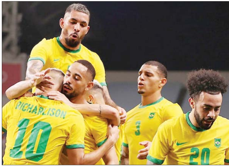
အောင်ပွဲခံနေသော ဘရာဇီးအသင်းကို တွေ့ရစဉ်။