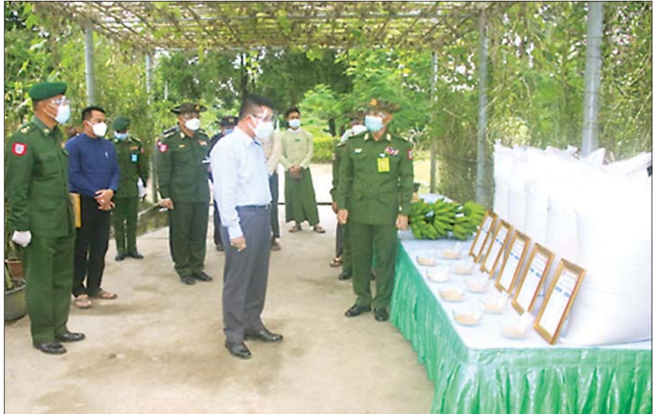
ဧရာဝတီတိုင်းဒေသကြီး ဝန်ကြီးချုပ် ဦးတင်မောင်ဝင်း၊ အနောက်တောင်တိုင်းစစ်ဌာနချုပ် တိုင်းမှူး ဗိုလ်ချုပ် အောင်အောင်နှင့် တာဝန်ရှိသူများ ပုသိမ်မြို့၊ စံပြဘက်စုံစိုက်ပျိုးမွေးမြူရေးခြံအတွင်း ကြည့်ရှု စစ်ဆေးစဉ်။