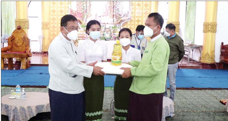
၂၀၀၊ စားသုံးဆီ ၁၀ ပိဿာပုံး ၃၅ ပုံ၊ ရောဂါနှာခေါင်းစည်း၊ မျက်နှာအကာများကို ထောက်ပံ့ပေးသည်။ ထို့အတူ ကိုဗစ်-၁၉ ရောဂါကာကွယ်ဆေး

ကျိုက်မရော ဩဂုတ် ၅ မွန်ပြည်နယ်ဝန်ကြီးချုပ် ဦးဇော်လင်းထွန်းနှင့် ဌာနဆိုင်ရာ တာဝန်ရှိသူများသည် ကိုဗစ်-၁၉ ရောဂါကာကွယ်ထိန်းချုပ်ရေးနှင့် အရေးပေါ်တုံ့ပြန်ရေးလုပ်ငန်းအတွက် လိုအပ်သည့် အောက်ဆီဂျင်များ၊ ကျန်းမာရေးအထောက်အကူပြုပစ္စည်းများ ပေးအပ်ခြင်းနှင့် ရေဘေးသင့်ပြည်သူများအတွက် စားသောက်ကုန်များ၊ ကျန်းမာရေးအထောက်အကူပြုပစ္စည်းများ ပေးအပ်ခြင်းကို ယမန်နေ့က ကျိုက်မရောမြို့ ဘုရားကြီးကျောင်းတိုက်၌ ပြုလုပ်သည်။ (ယာပုံ) ကျိုက်မရောမြို့နယ်တွင် ရေဘေးသင့်ပြည်သူများအတွက် မွန်ပြည်နယ် အစိုးရအဖွဲ့မှ အခြေခံစားသောက်ကုန်များဖြစ်သည့် ဆန် ၂၄ ပြည်အိတ်