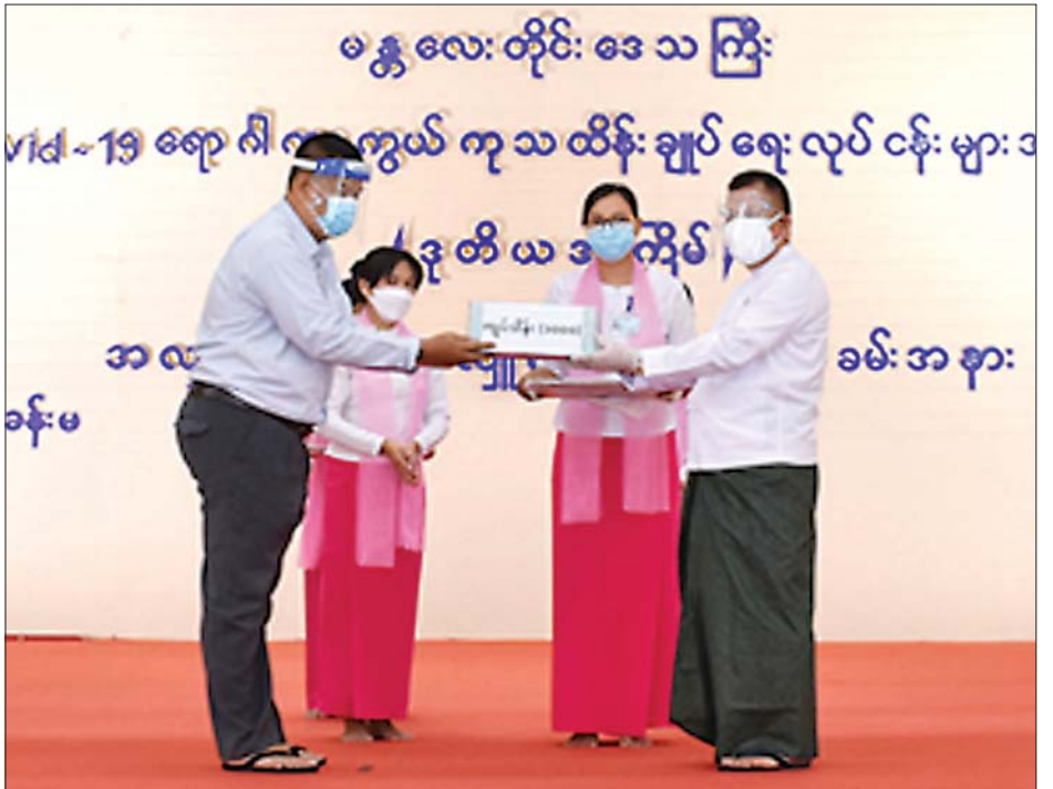
ဆောင်ရွက်စဉ် အဝင်/အထွက် ဂိတ်အသီးသီးတွင် အုပ်ချုပ်မှုကိစ္စများ ထောက်ပံ့ခြင်းတို့တွင် တာဝန်ထမ်းဆောင်နေကြသော ပူးပေါင်းအဖွဲ့များကို သုံးစွဲသွားမည်ဖြစ်ကြောင်း သိရသည်။ သတင်းစဉ်

ယနေ့လှူဒါန်းငွေ စုစုပေါင်းမှာ ငွေကျပ်သိန်း ၃၁၀၀ ဖြစ်ပြီး ယနေ့အထိလှူဒါန်းငွေ စုစုပေါင်း ငွေကျပ်သိန်း ၈၃၆၀ ဖြစ်ကြောင်းနှင့် လှူဒါန်းငွေများကို အောက်ဆီဂျင်စက်ရုံများ တိုးချဲ့တည်ဆောက်ခြင်း၊ အောက်ဆီဂျင်အရည်များ ဝယ်ယူခြင်း၊ စေတနာ့ဝန်ထမ်းများအတွက် ကိုဗစ်ကာကွယ် ကုသရေး အထောက်အကူပြုပစ္စည်းများ စက်သုံးဆီများ ဝယ်ယူခြင်း၊ Stay at Home