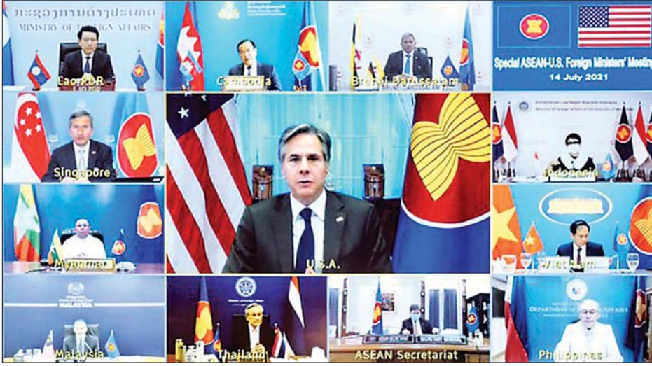
အမေရိကန်နိုင်ငံခြားရေးဝန်ကြီး အန်တိုနီ ဘလင်ကန် အာဆီယံနိုင်ငံခြားရေး ဝန်ကြီးများ အဖွဲ့အစည်းအဝေး၌ မိန့်ခွန်းပြောကြားစဉ်။