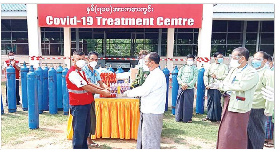
သံဃာတော်၊ သီလရှင်အပါး ၂၂၀၀ တို့တွင် ဆက်လက်ထိုးနှံပေးလျက်ရှိကြောင်း သိရသည်။ ကာကွယ်ဆေး ထိုးနှံပေးရာတွင် စစ်ကိုင်းမြို့နယ်အနေဖြင့် သံဃာတော်၊ သီလရှင်အပါး ၂၂၀၀ တို့တွင် ဆက်လက်ထိုးနှံပေးလျက်ရှိကြောင်း သိရသည်။ စော်မြင့်နိုင်(ပြန်/ဆက်)

ပြောကြားကာ ကာကွယ်ရေးသုံးပစ္စည်းများ လုံလောက်မှု ရှိ/ မရှိတို့ကို ကြည့်ရှုစစ်ဆေးသည်။ ထို့နောက်နှစ်ဂုဏ်အားကစားကွင်းရှိ ကိုဗစ်-၁၉ ရောဂါသံသယလူနာစောင့်ကြည့်ရေးနှင့် သယ်ယူပို့ဆောင်ရေးအဖွဲ့များသို့အောက်ဆီဂျင်ဘူး၊ ရောဂါကာကွယ်ရေးဝတ်စုံများနှင့် စားသောက်ဖွယ်ရာများ ထောက်ပံ့ပေးအပ်သည်။ (ယာပုံ) ထို့နောက် ခရိုင်စီမံအုပ်ချုပ်ရေးအဖွဲ့ရုံး အစည်းအဝေးခန်းမ၌ ဌာနဆိုင်ရာများနှင့် တွေ့ဆုံ၍ လုပ်ငန်းလမ်းညွှန်ချက်များမှာကြားကာ ခရိုင်စီမံအုပ်ချုပ်ရေးအဖွဲ့ ဥက္ကဋ္ဌ ဦးဆန်းထွန်းစိန်က ခရိုင်အတွင်း ဒေသအချက်အလက်များကို သက်ဆိုင်ရာဌာနဆိုင်ရာများက မိမိတို့၏ လုပ်ငန်းဆောင်ရွက်ချက်များကို တင်ပြကြရာ တင်ပြချက်များအပေါ် ဝန်ကြီးချုပ်က ပေါင်းစပ်ညှိနှိုင်း ဆောင်ရွက်ပေး