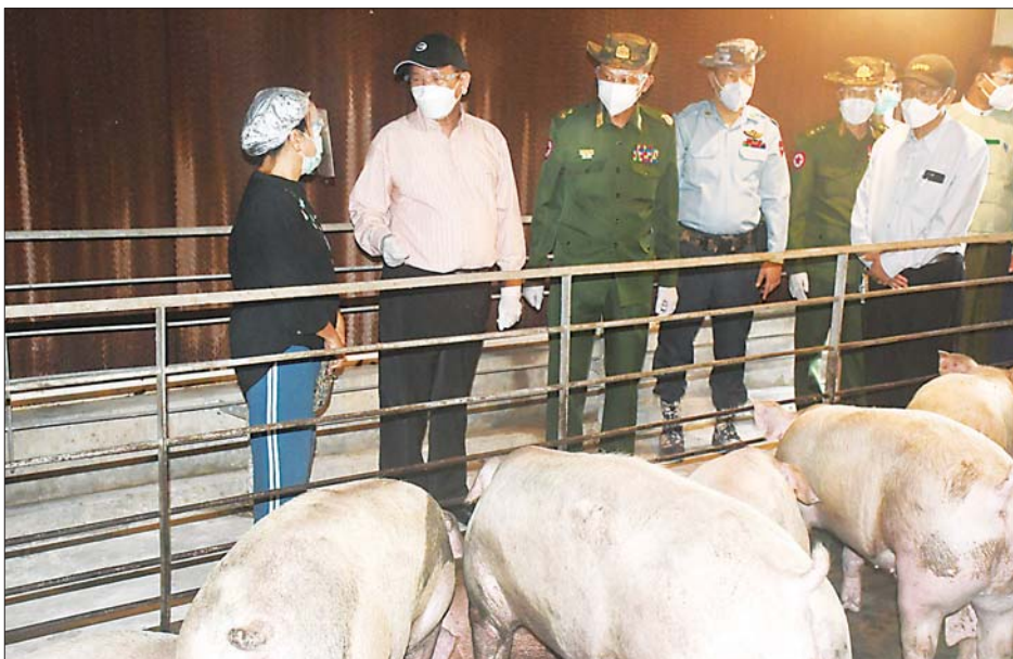
လျှင် ကြက်ဥ အလုံး ၂၀၀၀၀ ခန့် ထွက်ရှိမှုနှင့် ဝက်ခြံများတွင် အသားတိုးဝက် အကောင်ရေ ၉၅၀ ကျော် မွေးမြူထားရှိမှုတို့ကို လည်းကောင်း သွားရောက် ဆောင်ရွက်နိုင်ရေး လိုအပ်သည် များ ညှိနှိုင်းဖြည့်ဆည်းဆောင်ရွက် ပေးခဲ့ကြောင်း သိရသည်။ ဆန်းကျော်ဦး(ပြန်/ဆက်)

အကောင်ရေ ၁၀၀၀၀ မွေးမြူ ထားရှိမှုကိုလည်းကောင်း၊ ဝါးနက် ချောင်းကျေးရွာရှိ တိုင်းစစ်ဌာန ချုပ် ဘက်စုံစိုက်ပျိုးရေး မွေးမြူရေး စခန်း(ဝါးနက်ချောင်း)၌ အသား တိုးကြက် ၂၂၀၀၊ ဆိတ်ခြံနှစ်ခြံ တွင် ၉၅ ကောင် မွေးမြူထားရှိမှု နှင့် တစ်သျှူးငှက်ပျော အပင် ၁၀၀၀ စိုက်ပျိုးထားရှိမှုကို လည်းကောင်း၊ အမှတ်(၄) လမ်းမ ကြီးအနီး၊ ဖန်ခါးကုန်းကျေးရွာရှိ ပုဂ္ဂလိကပိုင် ရွက်သစ်မွေးမြူရေး ခြံ၌ ကြက်ခြံ ၁၂ ခြံတွင် ဥစား ကြက်အကောင်ရေ ၃၀၀၀၀ ကျော် မွေးမြူထားရှိပြီး တစ်နေ့