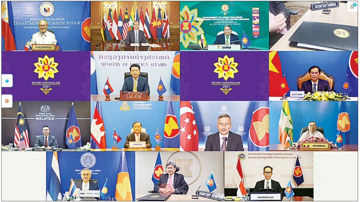
ပြည်ထောင်စုဝန်ကြီး ဦးဝဏ္ဏမောင်လွင် ဗီဒီယိုကွန်ဖရင့်ဖြင့်ကျင်းပသည့် အာဆီယံ-ကနေဒါ နိုင်ငံခြားရေးဝန်ကြီးများ အစည်းအဝေးတွင် ပူးတွဲသဘာပတိအဖြစ် တာဝန်ယူဆောင်ရွက်ပြီး အာဆီယံ-နယူးဇီလန် နိုင်ငံခြားရေးဝန်ကြီးများအစည်းအဝေးတက်ရောက်စဉ်။

ထို့နောက် ကနေဒါနှင့် မြန်မာနိုင်ငံတို့မှ နိုင်ငံခြားရေးဝန်ကြီးများနှင့် ၂၀၂၁-၂၀၂၄ ကာလအတွက် အာဆီယံ-ကနေဒါ ဆွေးနွေးဖက်ဆက်ဆံ ရေး ညှိနှိုင်းရေးနိုင်ငံအဖြစ် တာဝန်ယူမည့် မလေးရှားနိုင်ငံခြားရေး ဝန်ကြီးတို့က နိဂုံးချုပ်အမှာစကားပြောကြားသည်။ နိဂုံးချုပ် အမှာစကားပြောကြားရာတွင် ပြည်ထောင်စုဝန်ကြီးက အာဆီယံနှင့် ကနေဒါနိုင်ငံတို့အကြား ရင်းနှီးပွင့်လင်းစွာ ဆွေးနွေးမှုများသည် အာဆီယံ-ကနေဒါ ဆွေးနွေးဖက်ဆက်ဆံရေးကို မြှင့်တင်ရန် နည်းလမ်း များကို ပြသပေးနိုင်ကြောင်း၊ အာဆီယံအနေဖြင့် ဒေသတွင်း အေးချမ်း သာယာဝပြောရေး၊ အပြန်အလှန်အကျိုးစီးပွားနှင့် ပူးပေါင်း ဆောင်ရွက် ရန် အလားအလာရှိသည့်ကဏ္ဍများတွင် ကနေဒါနှင့် နီးကပ်စွာ လက်တွဲ ဆောင်ရွက်နိုင်မည်ဟု မျှော်လင့်ကြောင်း၊ မြန်မာနိုင်ငံနှင့် ကနေဒါနိုင်ငံ တို့သည် ကာလရှည်ကြာသည့် ဆက်ဆံရေးကောင်းများရှိခဲ့ပြီး မြန်မာ နိုင်ငံ၏ ကြိုးပမ်းဆောင်ရွက်မှုများတွင် ကနေဒါနိုင်ငံမှ ပူးပေါင်းဆောင် ရွက်မည်ဟု မျှော်လင့်ကြောင်းပြောကြားပြီး အာဆီယံတူညီဆန္ဒ(၅) ချက်နှင့်စပ်လျဉ်း၍ ပြည်ထောင်စုဝန်ကြီးက မြန်မာနိုင်ငံအနေဖြင့် အာဆီယံဥက္ကဋ္ဌ ဘရူနိုင်းနိုင်ငံမှ ဘရူနိုင်းနိုင်ငံခြားရေးဝန်ကြီး (၂) H.E. Dato Erywan Pehin Yusof အား အထူးကိုယ်စားလှယ်အဖြစ် ခန့်အပ် ရန် အဆိုပြုချက်ကို ကြိုဆိုခဲ့ကြောင်းနှင့် အထူးကိုယ်စားလှယ်အဖြစ်