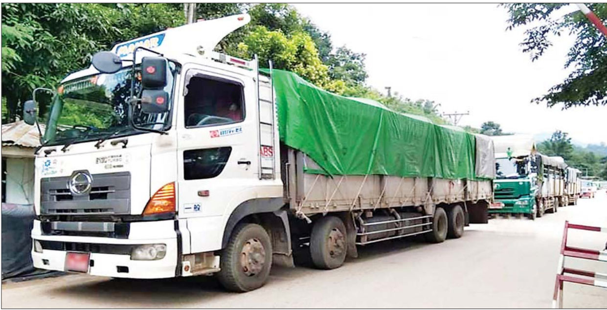
ချင်းရွှေဟော်နယ်စပ်ကုန်သွယ်ရေးစခန်းမှ ကိုဗစ်-၁၉ ကာကွယ်ဆေးများ တင်သွင်းလာသည့် မော်တော်ယာဉ်များကို တွေ့ရစဉ်။