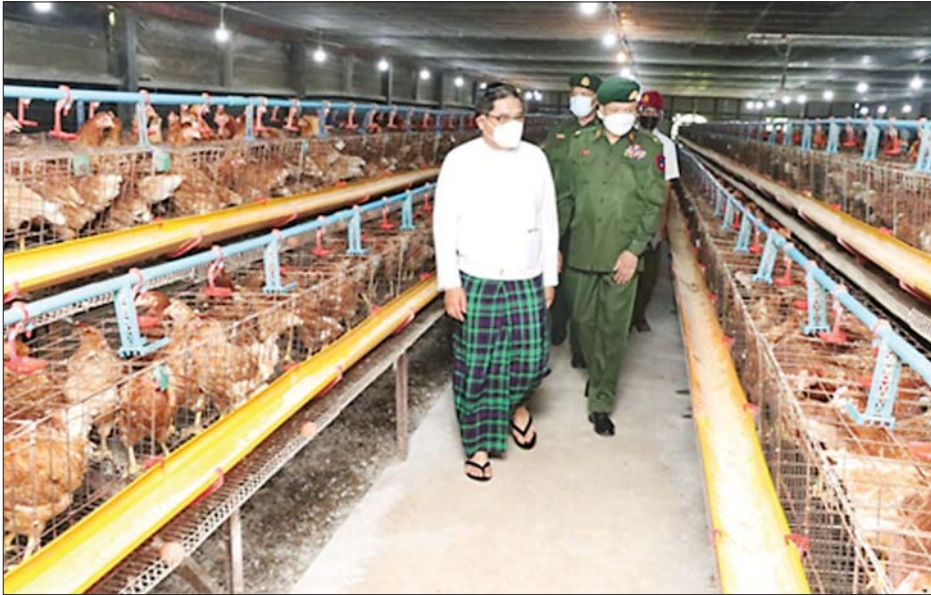
ကချင်ပြည်နယ် ဝန်ကြီးချုပ် ဦးခက်ထိန်နန်း၊ မြောက်ပိုင်းတိုင်းစစ်ဌာနချုပ် တိုင်းမှူး ဗိုလ်မှူးချုပ် မြတ်သက်ဦးနှင့် အဖွဲ့ဝင်များ တိုင်းစစ်ဌာနချုပ် ဘက်စုံစိုက်ပျိုးမွေးမြူရေးစခန်း၌ စိုက်ပျိုး၊ မွေးမြူရေးခြံအား ကြည့်ရှုစစ်ဆေးစဉ်။