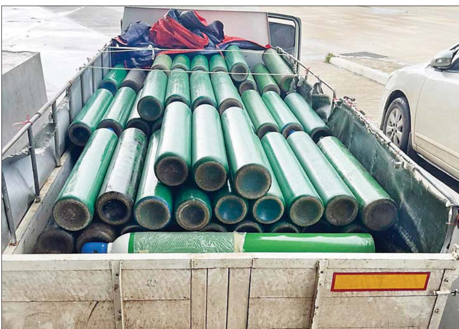
အောက်ဆီဂျင်အရည်အိုးများ တင်ဆောင်လာသည့် မော်တော်ယာဉ်တစ်စီးကို တွေ့ရစဉ်။

အများပြည်သူ ရုံးပိတ်ရက် များတွင်လည်း ကိုဗစ်-၁၉ ရောဂါ ကာကွယ်ကုသရေး ဆေးဝါးနှင့် ဆက်စပ်ပစ္စည်းများကို အပြည် ပြည်ဆိုင်ရာ လေကြောင်း၊ ရေကြောင်းဆိပ်ကမ်းများအပြင် တရုတ်နိုင်ငံ ကုန်သွယ်ရေးစခန်း များသာမက ထိုင်းနိုင်ငံ၊ အိန္ဒိယ နိုင်ငံ၊ ဘင်္ဂလားဒေ့ရှ်နိုင်ငံ၊ ကုန်သွယ်ရေး စခန်းများမှ တင်သွင်းနိုင်ရေး သံတမန် လမ်းကြောင်းမှ ညှိနှိုင်းစီစဉ် ဆောင်ရွက်ပေးလျက်ရှိကြောင်း သိရသည်။