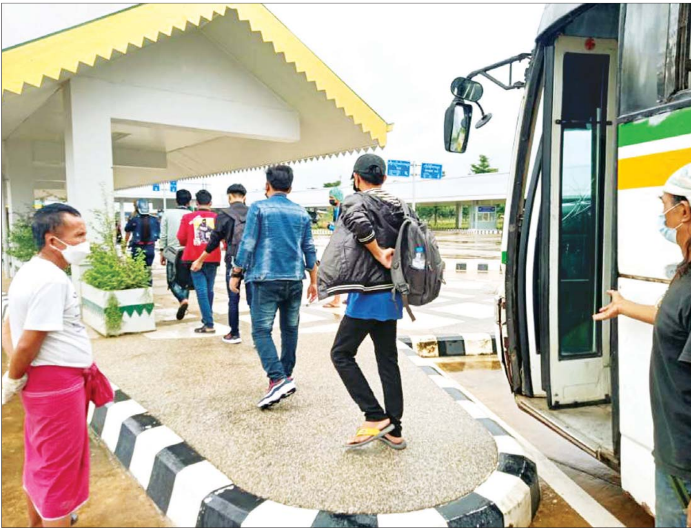
မြဝတီမြို့၊ မြန်မာ- ထိုင်း အမှတ်(၂) ချစ်ကြည်ရေးတံတားမှတစ်ဆင့် မြန်မာနိုင်ငံသားများ ပြန်လည်ဝင်ရောက်လာမှုကို တွေ့ရစဉ်။

၄။ တစ်နိုင်ငံလုံး ထာဝရငြိမ်းချမ်းရေးရရှိရေးအတွက် တစ်နိုင်ငံလုံး ပစ်ခတ်တိုက်ခိုက်မှု ရပ်စဲရေးသဘောတူစာချုပ် (NCA) ပါ သဘောတူညီချက်များအတိုင်း ဖြစ်နိုင်သမျှ အလေးထား လုပ်ဆောင်သွားမည်။ ၅။ အရေးပေါ်ကာလဆိုင်ရာ ပြဋ္ဌာန်းချက်များနှင့်အညီ ဆောင်ရွက်ပြီးစီးပါက ဖွဲ့စည်းပုံအခြေခံဥပဒေ (၂၀၀၈ ခုနှစ်) နှင့်အညီ လွတ်လပ်ပြီး တရားမျှတသော ပါတီစုံဒီမိုကရေစီ အထွေထွေရွေးကောက်ပွဲအား ပြန်လည်ကျင်းပ၍ အနိုင်ရသည့်ပါတီအား ဒီမိုကရေစီစံနှုန်းများနှင့်အညီ နိုင်ငံတော်တာဝန်အား လွှဲအပ်နိုင်ရေး ဆက်လက်ဆောင်ရွက်သွားမည်။