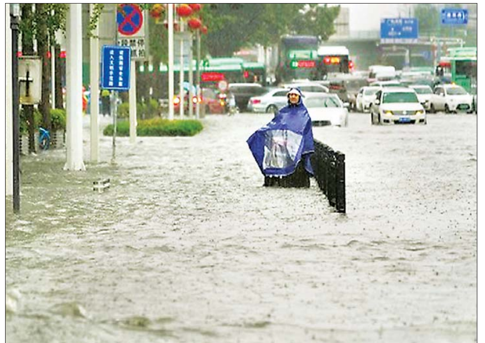
တရုတ်နိုင်ငံ ဝှမ်းဒေါင်းပြည်နယ်သို့ လူပစ်မုန်တိုင်း ဝင်ရောက်တိုက်ခတ်ခဲ့သဖြင့် လမ်းများ ရေလွှမ်းမိုးနေသည်ကို တွေ့ရစဉ်။

ခိုနားခဲ့သည်။ တိုင်ဖွန်းမုန်တိုင်း လူပစ်ကြောင့် နောက်သုံးရက်အတွင်း လေပြင်း တိုက်ခတ်မှုများနှင့် မိုးရွာသွန်းမှုများ ဆက်လက်ဖြစ်ပွားနိုင်သည်။ ထို့ပြင် တိုင်ဖွန်းမုန်တိုင်း လူပစ်သည် တရုတ်နိုင်ငံအရှေ့ပိုင်း ဖူကျန်းပြည်နယ်သို့ ဒုတိယအကြိမ် ဝင်ရောက် တိုက်ခတ်ခဲ့ပြီး မိုးသည်းထန်စွာ ရွာသွန်းခဲ့သောကြောင့် လူထောင်ပေါင်းများစွာ ရွှေ့ပြောင်းမှုများ လုပ်ဆောင်ခဲ့ရသည်။ ဆင်ဟွာ