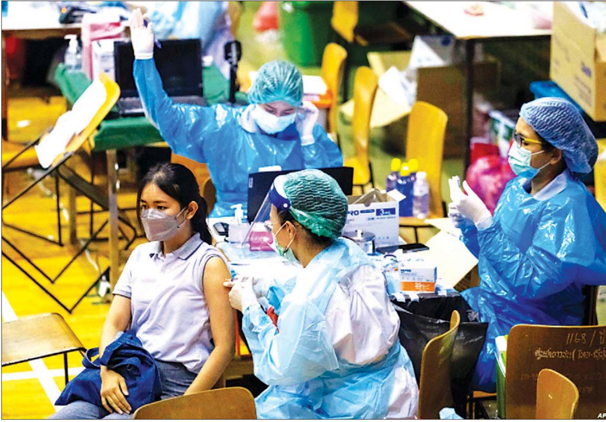
ထိုင်းနိုင်ငံ ဘန်ကောက်မြို့၌ ကိုဗစ်-၁၉ ကာကွယ်ဆေးထိုးပေးနေမှုကို တွေ့ရစဉ်။

တရုတ်နိုင်ငံရဲ့ ဆီနိုဗက်ကိုဗစ်-၁၉ ကာကွယ်ဆေးဟာ ထိုင်းနိုင်ငံ ကို ပထမဆုံးရောက်ရှိလာတဲ့ ကာကွယ်ဆေးဖြစ်သလို အဓိကကာကွယ် ဆေးကို အနုတင်က ပထမအကြိမ် ထိုးနှံနိုင်ခဲ့ပါတယ်။ ဆီနိုဗက် ကိုဗစ်-၁၉ ကာကွယ်ဆေးဟာ ထိုင်းနိုင်ငံအတွင်း ကိုဗစ်-၁၉ ကာကွယ်ဆေးစတင်ထိုးတဲ့နေရာမှာ အများကြီး အထောက်အပံ့ ဖြစ်ခဲ့ပါတယ်။ ထိုင်းပြည်သူတွေကို ကိုဗစ်-၁၉ ကာကွယ်ဆေးထိုးနှံ ပေးတဲ့နေရာမှာ အဓိကကာကွယ်ဆေးလည်း ဖြစ်ခဲ့ပါတယ်။