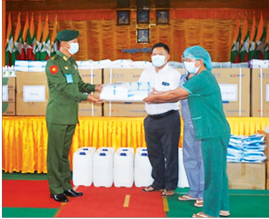
လားရှိုးမြို့ ကိုဗစ်-၁၉ ရောဂါ ကာကွယ်၊ ထိန်းချုပ်၊ ကုသရေး လုပ်ငန်းများတွင် ကူညီပါဝင်ဆောင်ရွက်နေသော ပရဟိတအဖွဲ့များနှင့် ကိုဗစ်-၁၉ ရောဂါပိုး ရှိ/မရှိ နှာခေါင်းတို့ဖက် စစ်ဆေးသောအသင်း(Swat Team) တို့အား အရှေ့မြောက်တိုင်းစစ်ဌာနချုပ် တိုင်းမှူးဗိုလ်ချုပ်နိုင်နိုင်ဦးက ကိုဗစ်-၁၉ ရောဂါ ကာကွယ်ရေး ပစ္စည်းများနှင့် စားသောက်ဖွယ်ရာများ ပေးအပ်လှူဒါန်းစဉ်။

ထို့ပြင် တိုင်းဒေသကြီးနှင့် ပြည်နယ်အသီးသီး၌ အောက်ဆီဂျင်လိုအပ်ချက်များ မရှိစေရေးအတွက် ကျန်းမာရေးဝန်ကြီးဌာနမှ Oxygen Plant များကို တိုးမြှင့် တပ်ဆင်လည်ပတ်လျက်ရှိပြီး တပ်မတော်အနေဖြင့်လည်း တိုင်းစစ်ဌာနချုပ် နယ်မြေအသီးသီးတွင် Oxygen Plant များကို တပ်ဆင်ထုတ်လုပ်ပေးလျက်ရှိရာ ယနေ့တွင် မွန်ပြည်နယ် မော်လမြိုင်မြို့ အထွေထွေရောဂါကုဆေးရုံကြီးတွင် တပ်ဆင်ထားသော အောက်ဆီဂျင် ထုတ်လုပ်နေမှု၊ အောက်ဆီဂျင်ဖြန့်ဖြူးပေးနေမှုများနှင့် ကျောက်တန်းစက်ရုံစုရှိ သံလွင်အောက်ဆီဂျင်စက်ရုံမှ အောက်ဆီဂျင် ထုတ်လုပ်နေမှုများကို လည်းကောင်း၊ ဧရာဝတီတိုင်းဒေသကြီး ပုသိမ်မြို့ အမှတ် (၂) ရပ်ကွက် ကမ်းနားလမ်းရှိ အောက်ဆီဂျင်စက်ရုံနှင့် မြောင်းမြမြို့ မြကန်သာရပ်ကွက်ရှိ အောက်ဆီဂျင်စက်ရုံ တည်ဆောက်နေသည့် အခြေအနေများကို လည်းကောင်း သက်ဆိုင်ရာ တိုင်းဒေသကြီးနှင့် ပြည်နယ်အသီးသီးတို့မှ ဝန်ကြီးချုပ်များ၊ တိုင်းစစ်ဌာနချုပ် အသီးသီးမှ တိုင်းမှူးများနှင့် တာဝန်ရှိသူများက သွားရောက်ကြည့်ရှုပြီး လိုအပ်သည်များ ညှိနှိုင်းဆောင်ရွက်ပေးခဲ့ကြကြောင်း သတင်းရရှိသည်။ သတင်းစဉ်