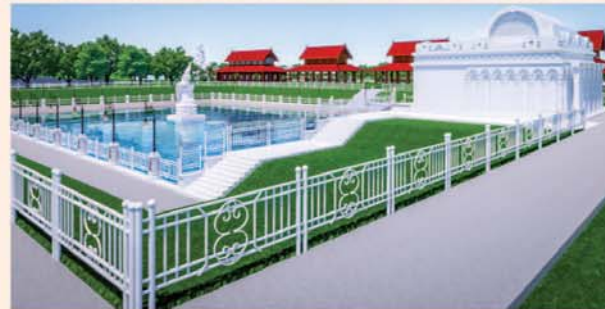
မုစလိန္နုတိုင်

၁။ နိုင်ငံတော်စီမံအုပ်ချုပ်ရေးကောင်စီဥက္ကဋ္ဌ၊ တပ်မတော်ကာကွယ်ရေးဦးစီးချုပ် ဗိုလ်ချုပ်မှူးကြီးမင်းအောင်လှိုင် ဦးဆောင်သည့် (၇)ရက်သား၊ သမီး၊ ဘုရားဒါယကာ၊ ဒါယိကာမတို့က မာရဝိဇယပုဒ္ဓရုပ်ပွားတော်မြတ်ကြီးအား မြန်မာနိုင်ငံတွင် ထေရဝါဒပုဒ္ဓသာသနာတော်ထွန်းလင်းတောက်ပလျက်ရှိသည်ကို ကမ္ဘာကိုပြသရန်၊ တိုင်းပြည်အေးချမ်းသာယာမှုရှိစေရန်၊ ရုပ်ပွားတော်မြတ်ကြီးအား ပြည်တွင်း၊ ပြည်ပဘုရားဖူးများလာရောက်ခြင်းဖြင့် ဒေသတိုးတက်စည်ကားမှုကို အထောက်အကူဖြစ်စေရန်၊ နိုင်ငံတော်ဖွံ့ဖြိုးတိုးတက်မှုအား အထောက်အကူ ဖြစ်စေရန်ရည်သန်လျက် ပြည်ထောင်စုနယ်မြေ နေပြည်တော်၊ ဒက္ခိဏသီရိမြို့နယ်အတွင်း၌ သာသနာတော်ထုံး၊ ရုပ်ပွားဆင်းတုတော်ထုံး၊ မြန်မာ့ရိုးရာတည်ထုံးများနှင့်အညီ တည်ဆောက် ပူဇော်လျက်ရှိပါသည်။