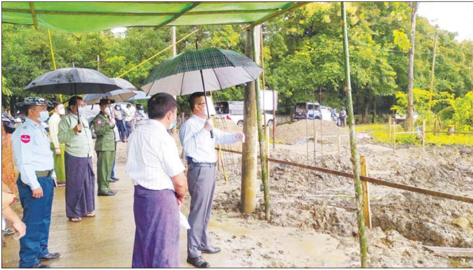
ဧရာဝတီတိုင်းဒေသကြီး ဝန်ကြီးချုပ် ဦးတင်မောင်ဝင်းနှင့် အဖွဲ့ဝင်များ ဆေးသိုလှောင်ရုံနှင့် ခွဲစိတ်ဆောင် အဆောက်အအုံသစ် ဆောက်လုပ်နေမှုကို ကြည့်ရှုနေစဉ်။

ရေကြည် ဩဂုတ် ၅ ဧရာဝတီတိုင်းဒေသကြီး ဝန်ကြီးချုပ် ဦးတင်မောင်ဝင်းနှင့် အဖွဲ့ဝင်များသည် ယနေ့နံနက်ပိုင်းက ရေကြည်မြို့နယ် ပြည်သူ့ဆေးရုံတွင် ဆေးသိုလှောင်ရုံနှင့် ခွဲစိတ်ဆောင်အဆောက်အအုံအသစ်အား ကြည့်ရှုကာ မြို့နယ်ကျန်းမာရေးမှူးဒေါက်တာအေးအေးလင်းအား အောက်ဆီဂျင်ရရှိနိုင်မှု အခြေအနေကို မေးမြန်း၍ လိုအပ်သည်များ မှာကြားသည်။ ဆက်လက်၍ ဆေးရုံတွင် ဆေးကုသမှုခံယူနေသော လူနာများအား လိုက်လံကြည့်ရှု၍ အားပေးစကားပြောကြားကြောင်း သိရသည်။ ထို့နောက် အ-ထ-က (မြို့မ) ကျောင်း၌ ပြည်သူများအား ကာကွယ်ဆေးထိုးနှံပေးမှုကို ကြည့်ရှုကာ ဆေးလာရောက်ထိုးနှံပြီး၍ နာရီဝက်စောင့်ဆိုင်းနေသော မိဘပြည်သူများကို ရေသန့်တူး၊ ကြက်ဥပြုတ်နှင့် နို့မှုန့်ထုပ်များ ပေးဝေကြောင်း သိရသည်။