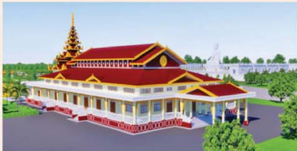
ဓမ္မာရုံ(၂၀၃x၉၀)ပေ ၀ လုံး-၈၇၃၀ သိန်း