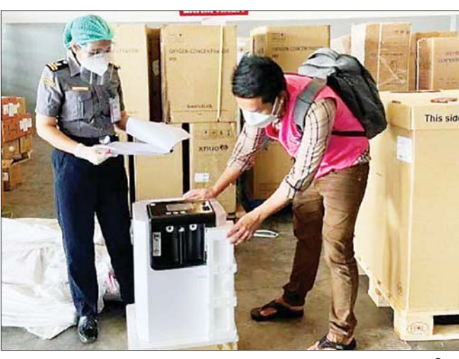
Meter ၁၂၃၅ ခု၊ Oxygen Mask ၇၀၀ ၊ Oxygen Regulator ၂၃၉၆ ခု၊ Oxygen Cylinder ၁၄၆၁၂ ခု၊ Oxygen Cylinder Trolley ၂၀၀ ခုတို့ကို ထုတ်ပေးခဲ့ကြောင်း သတင်းရရှိသည်။ သတင်းစဉ်

နေပြည်တော် ဩဂုတ် ၃ အကောက်ခွန်ဦးစီးဌာနအနေဖြင့် ကိုဗစ်-၁၉ ရောဂါ ကာကွယ်၊ ထိန်းချုပ်၊ ကုသရေးဆေးနှင့် ပစ္စည်းများအား လေကြောင်း၊ ဆိပ်ကမ်း၊ နယ်စပ်ဂိတ် အသီးသီးမှ ရုံးပိတ်ရက်ရှည်ကာလအတွင်း နေ့စဉ်ရုံးပိတ်ရက်မရှိ လွယ်ကူ ချောမွေ့စွာ စစ်ဆေးထုတ်ပေးလျက်ရှိရာ ဩဂုတ် ၃ ရက်၌ ရန်ကုန် အပြည်ပြည်ဆိုင်ရာလေဆိပ်တွင် ကုမ္ပဏီ ၁၀၀ မှ 94-Mask ၁၁၄၃၀၊ Flow meter ၆၇၄ ခု၊ Oxygen Regulator ၃၂၃ ခု၊ Oximeter ၄၈၀၈၂ ခု၊ Oxygen Concentrator ၁၀၈၁၁ ခု၊ Oxygen Mask ၅၁၅၀၂၊ Test Kit ၃၃၉၄၂ ခု၊ ရန်ကုန်ဆိပ်ကမ်းများတွင် ကိုဗစ်-၁၉ ကာကွယ်ကုသရေးနှင့်အခြား ဆေးမျိုးစုံ ၆၉၇၇၅ ဒဿမ ၉၆ Kg ၊ နယ်စပ်(မူဆယ်၊ ချင်းရွှေဟော်၊ ကန်ပိုက်တီး၊ တာချီလိတ်၊ ကော့သောင်း၊ မြဝတီ) တွင် ကုမ္ပဏီ ၅၆ ခုမှ Oxygen Generator ၅ ခု၊ Mask ၁၈၀၀၀ KG၊ Liquid Oxygen ၁၅၇၄၄ ဒဿမ ၅၂ m3၊ Nasal Cannula ၅၀၀၀ စုံ၊ PPE အစုံ ၁၅၀၀၀၊ Test Kit ၃၀၀၀၀၊ Kn95 Mask ၃၅၀၀၀၊ Surgical Mask ၃၅၀၀၀၀၊ Exam Gloves ၃၀၀၀၀၀၊ Oximeter ၃၄၀၀၊ Oxygen Concentrator ၁၄၅၄ ခု၊ Flow