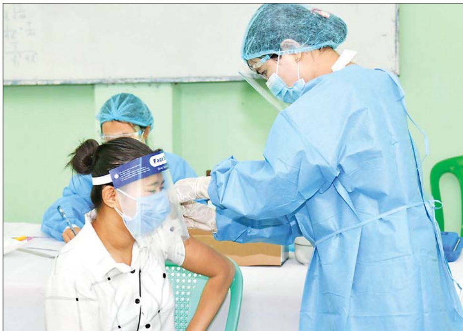
ဇေယျာသီရိမြို့နယ် ပြည်စံအောင် အခြေခံပညာအထက်တန်းကျောင်း၌ ကိုဗစ်-၁၉ ကာကွယ်ဆေးထိုးနှံစဉ်။

ထိန်းချုပ်၊ ကုသခြင်း လုပ်ငန်းများတွင် ရှေ့တန်းမှ တာဝန်ထမ်းဆောင်နေကြသော ကာကွယ်ဆေးမထိုးရသေးသည့် ကျန်းမာရေးဝန်ထမ်းများနှင့် ပုဂ္ဂလိက ကျန်းမာရေးဝန်ထမ်းများ၊ သာသနာ့ဝန်ထမ်းများ၊ ကိုဗစ် - ၁၉ ကာကွယ်၊ ထိန်းချုပ်၊ ကုသခြင်းလုပ်ငန်းများ ဆောင်ရွက်နေသော ကာကွယ်ဆေး မထိုးရသေးသည့် စေတနာ့ဝန်ထမ်းများ၊ ကာကွယ်ဆေးမထိုးရသေးသည့် နိုင်ငံ့ဝန်ထမ်းများ၊ ပုဂ္ဂလိက ဘဏ်ဝန်ထမ်းများ၊ ပုဂ္ဂလိက စက်ရုံ/အလုပ်ရုံဝန်ထမ်းများ၊ ဟိုတယ်/ မိုတယ်/ တည်းခိုခန်းများမှ ဝန်ထမ်းများ၊ စုပေါင်းကတ်များ/ ဈေးများမှ ဝန်ထမ်းများအား ကျန်းမာရေးဝန်ထမ်းများက ကိုဗစ် - ၁၉ ကာကွယ်ရေး နည်းလမ်းများနှင့်အညီ ဆေးထိုးနှံပေးသည်။ ယင်းသို့ ဆေးထိုးနှံပေးရာတွင် ဇေယျာသီရိ မြို့နယ် ပြည်စံအောင်အခြေခံပညာ အထက်တန်းကျောင်း၌ လူဦးရေ ၃၁၈ ဦးခန့်ကိုလည်းကောင်း၊ ပုဗ္ဗသီရိမြို့နယ် အမှတ်(၂၀) အခြေခံပညာ အထက်တန်းကျောင်း၌ လူဦးရေ ၄၀၀ ခန့်ကိုလည်းကောင်း၊ ဥတ္တရသီရိမြို့နယ် မင်းကုန်းအခြေခံပညာအထက်တန်းကျောင်း၌ လူဦးရေ ၃၀၈ ဦးကိုလည်းကောင်း၊ လယ်ဝေးမြို့နယ် အမှတ်(၁) အခြေခံပညာအထက်တန်းကျောင်း၌ လူဦးရေ ၈၀၀ ခန့်ကိုလည်းကောင်း၊ ဇေယျာသီရိမြို့နယ် အမှတ်(၇) အခြေခံပညာ အထက်တန်းကျောင်း၌ လူဦးရေ ၅၀၀ ခန့်ကိုလည်းကောင်း၊ ဒက္ခိဏသီရိမြို့နယ် အမှတ်(၁၈) အခြေခံပညာအထက်တန်းကျောင်း၌ လူဦးရေ ၁၉၀ ကိုလည်းကောင်း၊ တပ်ကုန်းမြို့နယ် အမှတ်(၁) အခြေခံပညာ အထက်တန်းကျောင်း၌ လူဦးရေ ၁၁၃၄ ဦးကိုလည်းကောင်း၊ ပျဉ်းမနားမြို့နယ် အမှတ်(၃) အခြေခံပညာ အထက်တန်းကျောင်း၌ လူဦးရေ ၅၆၀ ခန့်ကိုလည်းကောင်း