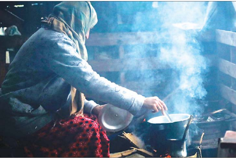
လျှပ်စစ်ဓာတ်အားမရသဖြင့် ထင်းမီးဖိုဖြင့် ဟင်းချက်နေရသော အိမ်ရှင်မတစ်ဦးကို တွေ့ရစဉ်။

အရ ဂါဇာကမ်းမြောင်းဒေသတွင် လူဦးရေ၏ ၂၅ ရာခိုင်နှုန်းမှာ မီးအားပေးစက်များမှ လျှပ်စစ်ဓာတ်အား ရယူရန် မတတ်နိုင်ကြဟု သိရသည်။ ဆင်ဟွာ