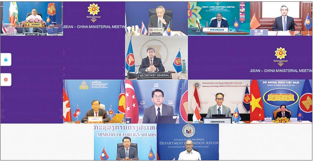
ပြည်ထောင်စုဝန်ကြီး ဦးဝဏ္ဏမောင်လွင် အာဆီယံနှင့် ဆွေးနွေးဖက်နိုင်ငံများအကြား သီးခြားစီ ကျင်းပပြုလုပ်သည့် နိုင်ငံခြားရေးဝန်ကြီးများ၏ အစည်းအဝေးများနှင့် (၂၂) ကြိမ်မြောက် အာဆီယံအပေါင်းသုံး နိုင်ငံခြားရေးဝန်ကြီးများ အစည်းအဝေးသို့ တက်ရောက်စဉ်။

အာဆီယံနှင့် ဆွေးနွေးဖက် နိုင်ငံများအကြား သီးခြားစီ ကျင်းပသည့် အစည်းအဝေးများ သို့ အာဆီယံနိုင်ငံများနှင့် ဆွေးနွေးဖက် နိုင်ငံများမှ နိုင်ငံခြားရေး ဝန်ကြီးများနှင့် ၎င်းတို့၏ ကိုယ်စားလှယ်များ တက်ရောက်ခဲ့ကြသည်။ အစည်း အဝေးများတွင် အာဆီယံနှင့် သက်ဆိုင်ရာ ဆွေးနွေးဖက်နိုင်ငံ အသီးသီးမှ နိုင်ငံခြားရေး ဝန်ကြီးများက အာဆီယံနှင့် သက်ဆိုင်ရာ ဆွေးနွေးဖက် နိုင်ငံများအကြား အနာဂတ်တွင် ပူးပေါင်းဆောင်ရွက်မှု ပိုမိုတိုးမြှင့် နိုင်မည့် အလားအလာများနှင့် ဒေသတွင်းနှင့် နိုင်ငံတကာရေးရာ ကိစ္စရပ်များကို အမြင်ချင်းဖလှယ် ဆွေးနွေးခဲ့ကြသည်။