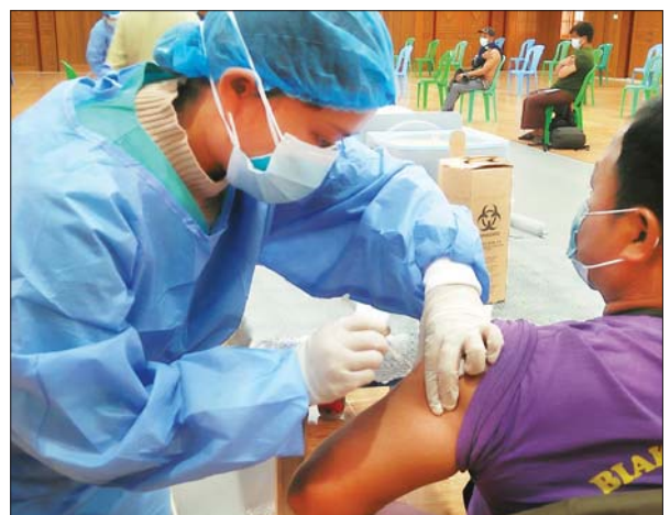
ချင်းပြည်နယ် ဖလမ်းမြို့နယ်။ ကိုရီရန်း(လောင်မြေ)