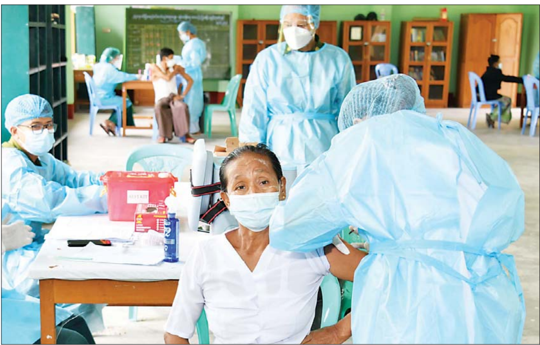
နေပြည်တော် ပုဗ္ဗသီရိမြို့နယ် အမှတ်(၂၀) အခြေခံပညာအထက်တန်းကျောင်း၌ ကိုဗစ်-၁၉ ရောဂါ ကာကွယ်ဆေး ထိုးနှံပေးစဉ်။

နေပြည်တော် ဩဂုတ် ၃ နေပြည်တော် ကောင်စီ နယ်မြေအတွင်း ကိုဗစ် - ၁၉ ရောဂါ ကာကွယ် ထိန်းချုပ်နိုင်ရန် အတွက် ကာကွယ်ဆေး ထိုးခြင်း လုပ်ငန်းများကို ဩဂုတ် ၁ ရက်မှ စတင်၍ ဆောင်ရွက်လျက်ရှိရာ ယနေ့တွင် သက်ဆိုင်ရာ မြို့နယ်များအလိုက် စုရပ်နေရာများခွဲ၍ ဦးတည်အုပ်စု များနှင့် ဦးစားပေး အစီအစဉ်များအလိုက် ဆက်လက် ဆေးထိုးနှံပေးကြသည်။ နေပြည်တော် ကောင်စီ နယ်မြေအတွင်းရှိ သတ်မှတ် ထားသည့် မြို့နယ်များအလိုက် စုရပ်နေရာများဖြစ်သော အခြေခံ ပညာအထက်တန်းကျောင်းများ၌ အသက် ၆၅ နှစ်နှင့်အထက်ရှိသူ များ၊ ကိုဗစ်- ၁၉ ကာကွယ်ဆေး စာမျက်နှာ ၅ ကော်လံ ၁ ၁