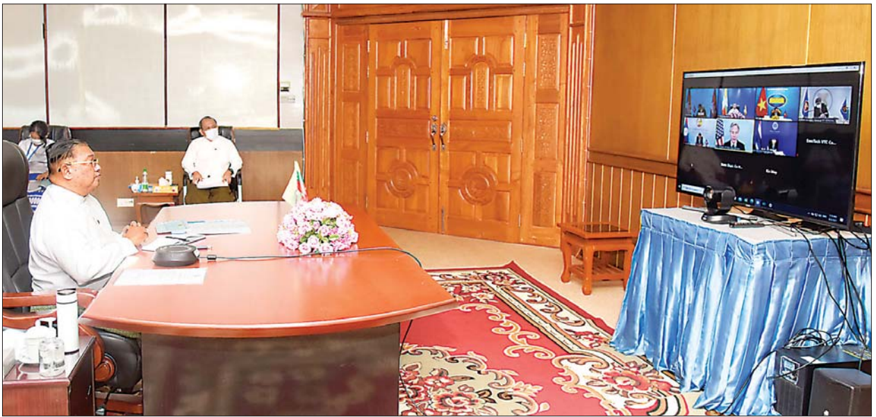
ပြည်ထောင်စုဝန်ကြီး ဦးဝဏ္ဏမောင်လွင် ဗီဒီယိုကွန်ဖရင့်စနစ်ဖြင့် ကျင်းပသည့် ဒုတိယအကြိမ်မြောက် မဲခေါင်-အမေရိကန် မိတ်ဖက်ပြု ပူးပေါင်းဆောင်ရွက်မှု အစီအစဉ် ဝန်ကြီးများအစည်းအဝေး (Second Mekong-U.S. Partnership Ministerial Meeting) သို့ ပါဝင်တက်ရောက်စဉ်။

ဆက်လက်၍ ပြည်ထောင်စုဝန်ကြီးက မဲခေါင်-အမေရိကန် မိတ်ဖက်ပြုပူးပေါင်းဆောင်ရွက်မှု အစီအစဉ်၏ အခြေခံမူများဖြစ်သော အားလုံးသဘောတူညီမှု၊ တန်းတူညီမျှမှုနှင့် ပြည်တွင်းရေး ဝင်ရောက်စွက်ဖက်ခြင်းမရှိမှု စသည့်မူများအပေါ်အခြေခံ၍ အလုံးစုံပါဝင်သော စဉ်ဆက်မပြတ်ဖွံ့ဖြိုးတိုးတက်ရေးကိုရှေ့ရှုကာ မဲခေါင်ဒေသပြည်သူများကို အကူအညီများ ပိုမိုပေးအပ်သွားရန် ထည့်သွင်းပြောကြားသည်။ ထို့ပြင် ပညာရေး၊ လူငယ်၊ စွမ်းအားမြှင့်တင်မှု၊ စွမ်းအင်နှင့် သဘာဝ