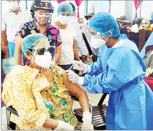
ပဲခူးတိုင်းဒေသကြီး တောင်ငူမြို့၌ ကိုဗစ်-၁၉ ကာကွယ်ဆေး ထိုးနှံပေးစဉ်။

ထိုသို့ ဆောင်ရွက်လျက်ရှိရာ ဩဂုတ် ၂ ရက်နှင့် ယနေ့တို့တွင် နေပြည်တော်ကောင်စီနယ်မြေအတွင်းရှိ မြို့နယ်ပေါင်း ၈ မြို့နယ်မှ အသက် ၆၅ နှစ်နှင့်အထက် သက်ကြီးဘိုးဘွားများ၊ ဌာနဆိုင်ရာဝန်ထမ်းများနှင့် ပြည်သူစုစုပေါင်း ၄၇၈၆ ဦးတို့ကိုလည်းကောင်း၊ ကချင်ပြည်နယ် အတွင်းရှိ မြို့နယ်ပေါင်း လေးမြို့နယ်မှ အသက် ၆၅ နှစ်နှင့်အထက် သက်ကြီးဘိုးဘွားများ၊ ဌာနဆိုင်ရာဝန်ထမ်းများ၊ တိုင်းရင်းသားပြည်သူများနှင့် အကျဉ်းထောင်တွင် ပြစ်ဒဏ်ကျခံနေသည့် အကျဉ်းသား၊ အကျဉ်းသူ စုစုပေါင်း ၂၄၇၆ ဦးတို့အား လည်းကောင်း၊ ရှမ်းပြည်နယ် (မြောက်ပိုင်း) ကျောက်မဲမြို့ရှိ အသက် ၆၅ နှစ်နှင့်အထက် သက်ကြီးဘိုးဘွားများနှင့် ဒေသခံတိုင်းရင်းသားပြည်သူ စုစုပေါင်း ၇၆၉ ဦးကိုလည်းကောင်း၊ ရှမ်းပြည်နယ်(တောင်ပိုင်း)အတွင်းရှိ မြို့နယ်ပေါင်း ၁၁ မြို့နယ်မှ သံဃာတော်များ၊ သာသနာ့ဓနယဝင် သီလရှင်များ၊ အသက် ၆၅ နှစ်နှင့်အထက် သက်ကြီးဘိုးဘွားများနှင့် ပြည်သူစုစုပေါင်း ၁၃၉၃၈ ဦးကိုလည်းကောင်း၊ ရှမ်းပြည်နယ် (အရှေ့ပိုင်း)အတွင်းရှိ မြို့နယ်ပေါင်း