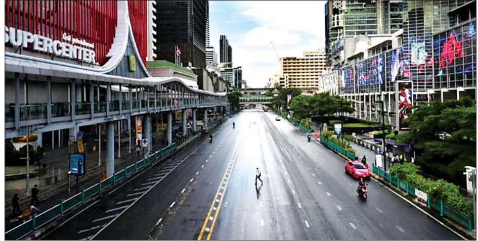
ဘန်ကောက်မြို့တွင် ကန့်သတ်မှုများကြောင့် ရှင်းလင်းနေသည့် လမ်းမကြီးကို တွေ့ရစဉ်။

၁၉ ကူးစက်ခံရသူ ၁၈၀၀၀ နီးပါးရှိခဲ့ပြီး ဗိုင်းရပ်စ်ကြောင့် သေဆုံးသူ ၁၇၈ ဦးအထိ ရှိခဲ့သည်။ ကူးစက်မှုများကို နှိမ်နင်းနိုင်ရေးအတွက် အစိုးရသည် ကာကွယ်ဆေးထိုးနှံပေးရေးအစီအစဉ်များကို အရှိန်အဟုန်မြှင့်လုပ်ဆောင်လျက်ရှိသည်။ အရှေ့တောင်အာရှနိုင်ငံများတွင် ကိုဗစ်-၁၉ ကူးစက်မှုများ များပြားနေပြီး ဇူလိုင် ၃၁ ရက်တွင် မလေးရှားနိုင်ငံ၌ နေ့စဉ်ကူးစက်ခံရသူ အရေအတွက်မှာ ၁၇၇၀၀ အထိ ရှိခဲ့သည်။