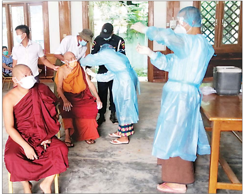
စစ်ကိုင်းတိုင်းဒေသကြီး ဗန်းမောက်မြို့နယ်။ ကျော်စွာ(ဗန်းမောက်)