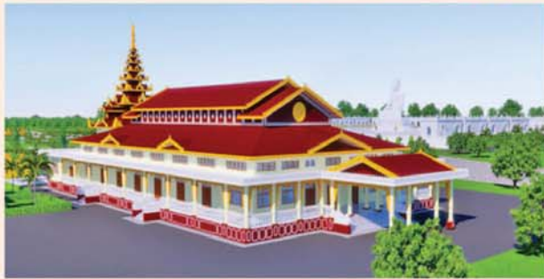
ဓမ္မာရုံ(၂၁၃x၉၀)ပေ ၁ လုံး-၈၇၃၀ သိန်း