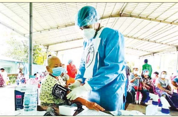
ရန်ကုန်အရှေ့ပိုင်းခရိုင် သာကေတမြို့နယ်၌ အသက် ၆၅ နှစ်နှင့် အထက် ပြည်သူတစ်ဦးအား ကိုဗစ်- ၁၉ ရောဂါ ကာကွယ်ဆေး ထိုးနှံမှုကို ဩဂုတ် ၁ ရက်က တွေ့ရစဉ်။