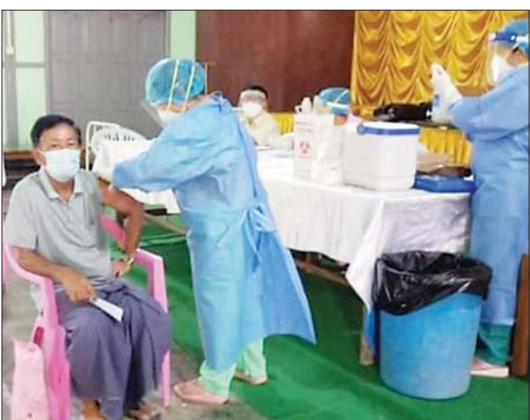
ရှမ်းပြည်နယ်(မြောက်ပိုင်း) သီပေါမြို့နယ်။ စိုင်း(သီပေါ)