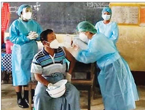
ဧရာဝတီတိုင်းဒေသကြီး ဟိုင်းကြီးကျွန်းမြို့နယ်။ မြို့နယ်(ပြန်/ဆက်)