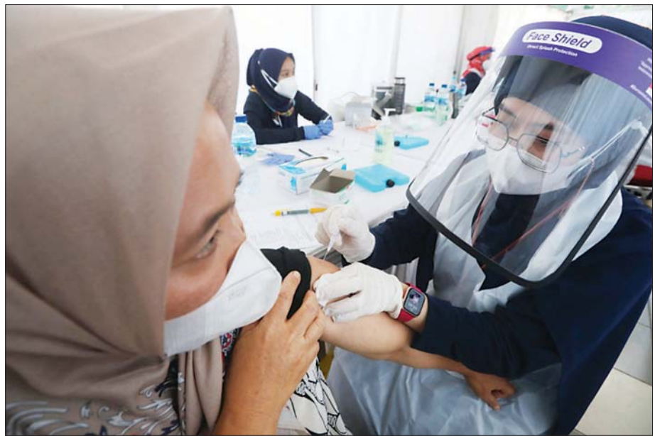
အင်ဒိုနီးရှားနိုင်ငံ၌ ကိုဗစ်-၁၉ ကာကွယ်ဆေး ထိုးနှံနေသည်ကို တွေ့ရစဉ်။