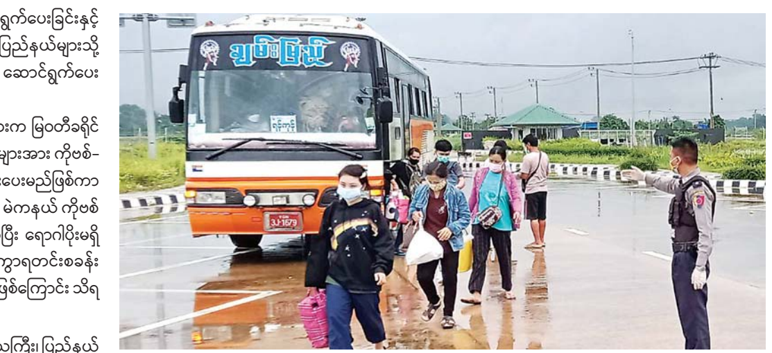
တို့ကို သက်ဆိုင်ရာ တိုင်းဒေသကြီး၊ ပြည်နယ် အစီအစဉ်များဖြင့် ဆောင်ရွက်မည် ဖြစ်သည်။ ယနေ့ ထိုင်းနိုင်ငံမှ ပြန်လည်ဝင်ရောက်လာသူ များအနေဖြင့် တိုင်းဒေသကြီး၊ ပြည်နယ်အသီးသီးမှ အမျိုးသား ၁၂၈ ဦး၊ အမျိုးသမီး ၇၈ ဦး စုစုပေါင်း ၂၀၆ ဦးရှိကြောင်း သိရသည်။

ရောဂါပိုးမရှိ စစ်ဆေးဆောင်ရွက်ပေးခြင်းနှင့် သက်ဆိုင်ရာ တိုင်းဒေသကြီး၊ ပြည်နယ်များသို့ ပြန်လည်ပို့ဆောင်ပေးခြင်းများကို ဆောင်ရွက်ပေး သည်။ ထိုသို့ထိုင်းနိုင်ငံမှ ပြန်လာသူများက မြဝတီခရိုင် နှင့် ကော့ကရိတ်ခရိုင်မှ နေရပ်ပြန်များအား ကိုဗစ်-၁၉ ရောဂါပိုးမရှိ မရှိ ချက်ချင်းစစ်ဆေးပေးမည်ဖြစ်ကာ ရောဂါပိုးရှိသူများအား မြဝတီမြို့ မဲကနယ် ကိုဗစ် စင်တာတွင် ကုသမှုခံယူစေမည်ဖြစ်ပြီး ရောဂါပိုးမရှိ သူများအား ကျောက်လုံးကြီး ကွာရတင်းစခန်း တွင် (၁၀)ရက် ကန့်သတ်ထားမည်ဖြစ်ကြောင်း သိရ သည်။ အခြားသက်ဆိုင်ရာ တိုင်းဒေသကြီး၊ ပြည်နယ် များမှနေရပ်ပြန်အား သီးသန့်မော်တော်ယာဉ်များဖြင့် သက်ဆိုင်ရာနေရပ်များသို့ ပို့ဆောင်ပေးမည်ဖြစ်ပြီး ရောဂါစစ်ဆေးခြင်းနှင့် ကန့်သတ်စောင့်ကြည့်ခြင်း