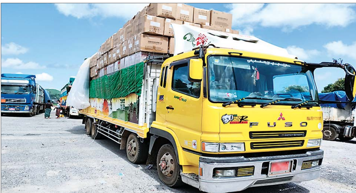
မူဆယ်နယ်စပ်ကုန်သွယ်ရေးစခန်းမှ ကိုဗစ်-၁၉ ကာကွယ်ရေး ဆေးဝါးနှင့် ဆက်စပ်ပစ္စည်းများ မော်တော်ယာဉ်များဖြင့် တင်သွင်းစဉ်။