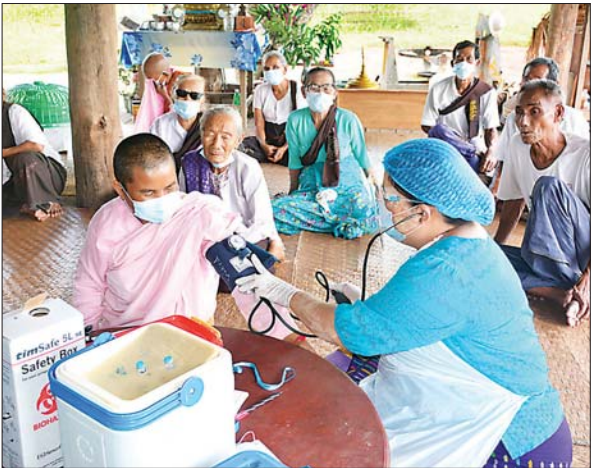
ရှမ်းပြည်နယ်(မြောက်ပိုင်း) မိုးမိတ်မြို့နယ်။ စည်သူဌေး