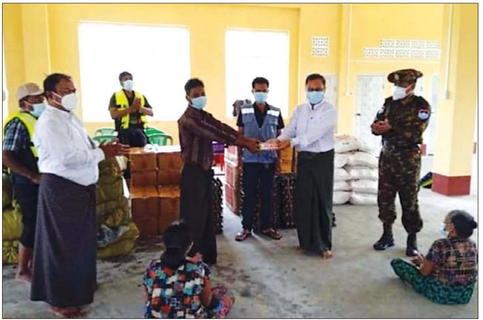
ယာယီကယ်ဆယ်ရေးစခန်းသို့ ပြောင်းရွှေ့နေထိုင်လျက်ရှိသော ရေဘေးသင့်ပြည်သူများအား ထောက်ပံ့ ငွေများ ပေးအပ်စဉ်။