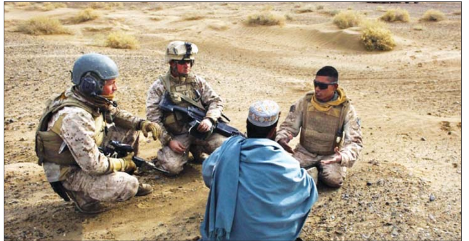
စကားပြန်၏ အကူအညီဖြင့် ဒေသခံတစ်ဦးကို မေးမြန်းနေသည့် အမေရိကန်တပ်ဖွဲ့ဝင်များကို တွေ့ရစဉ်။

အမေရိကန်တပ်ဖွဲ့အတွက် အလုပ်လုပ်ကိုင်ပေးခဲ့သူများကို အထူးရွှေ့ပြောင်းနေထိုင်ခွင့် ဗီဇာပေးရန် သဘောတူခဲ့သည်။ ရွှေ့ပြောင်းနေထိုင်ခွင့် ဗီဇာလျှောက်ထားရန် အချိန်သတ်မှတ်ချက်နှင့် မကိုက်ညီသည့် အာဖဂန်နိုင်ငံသားများအတွက် ဒုက္ခသည်အဆင့်အတန်းသတ်မှတ်ကာ အမေရိကန်နိုင်ငံအတွင်းသို့ ခေါ်ယူပေးမည်ဖြစ်သည်။ တာလီဘန်များ၏ လက်စားချေမည့် အန္တရာယ်နှင့် ရင်ဆိုင်နေရသည့် အမေရိကန်နှင့် ပူးပေါင်းခဲ့သည့် အာဖဂန်နိုင်ငံသားများအတွက် တာဝန်အပြည့်ရှိသည်ဟု အမေရိကန်နိုင်ငံခြားရေးဝန်ကြီး အန်တိုနီ ဘလင်ကန်က ပြောသည်။ အင်န်အိတ်ချ်ကေ