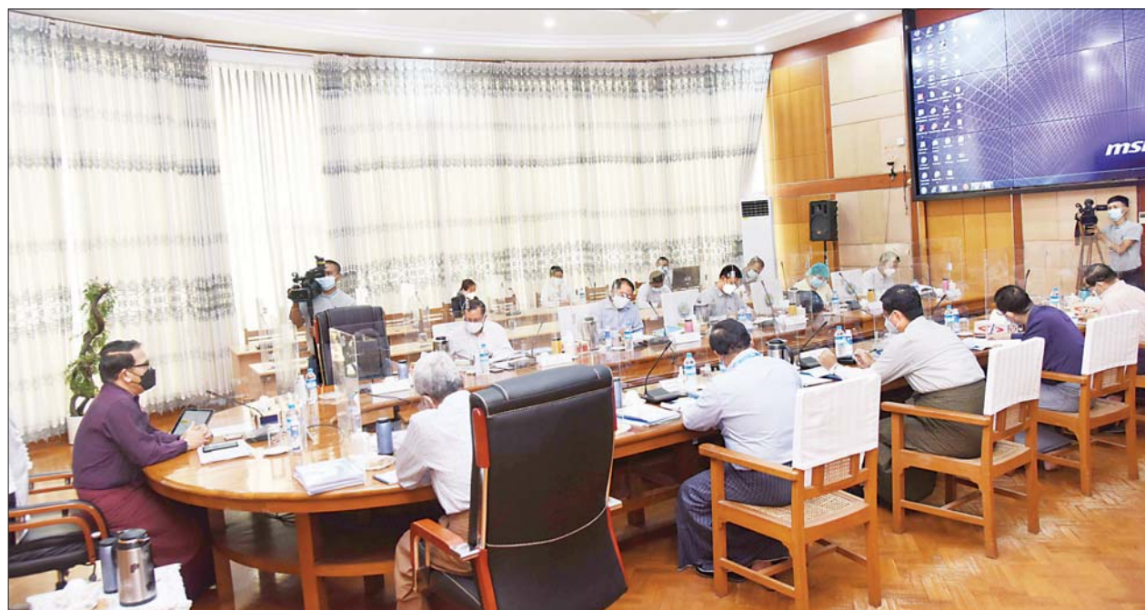
ပြည်ထောင်စုဝန်ကြီး ဦးမောင်မောင်အုန်း ပြန်ကြားရေးဝန်ကြီးဌာနမှ ဌာနအလိုက် လုပ်ငန်းဆောင်ရွက်ချက်များ ရှင်းလင်းတင်ပြပွဲတွင် အမှာစကားပြောကြားစဉ်။

အဟုန်မပျက် ဆက်လက် ဆောင်ရွက်ကြရန်လိုကြောင်း၊ အိမ်စောင့်အစိုးရ စတင်တာဝန်ထမ်းဆောင်သည့်ကာလတွင် ပြန်ကြားရေးဝန်ကြီးဌာန၏ ဆောင်ရွက်မှုများသည် မူဝါဒကို ပြောင်းလဲခြင်းမဟုတ်ဘဲ တင်ဆက်ပုံများကို ပိုမိုဆန်းသစ်အောင် ပြောင်းလဲဖန်တီးရမည်ဖြစ်ကြောင်း၊ လက်ရှိဆောင်ရွက်နေသည့် အနေအထားအပြင် အိမ်စောင့်အစိုးရ လက်ရှိအခြေအနေနှင့် ကိုက်ညီသည့် တင်ဆက်မှု၊ ဆောင်ရွက်မှုများကို စဉ်းစားသုံးသပ်ဆွေးနွေးပေးကြစေလိုပါကြောင်း။ မူဝါဒကို ထိန်းထား မီဒီယာဖြစ်သည့် အတွက် အချိန်ဆိုင်း၍ မရပါကြောင်း၊ အချို့ကိစ္စများသည် သွက်သွက်လက်လက် မြန်မြန်ဆန်ဆန် ဆောင်ရွက်ရမည်၊ မြန်ရမည်၊ မှန်ရမည် ဖြစ်ပါကြောင်း၊ ပြန်ကြားရေး ဝန်ကြီးဌာနသည် နိုင်ငံတော်အဆင့် ဌာနတစ်ခုဖြစ်ပြီး ဝန်ထမ်းကိစ္စ၊ မူဘောင်ကိစ္စများကို ယခင်အတိုင်း ဆောင်ရွက်ရမည်ဖြစ်သော်လည်း ပြောင်းလဲ၍ ရသည်များကို ပြောင်းလဲမည်ဖြစ်ပါကြောင်း၊ မူဝါဒကို ထိန်းထားရမည်ဖြစ်သကဲ့သို့ တစ်ဖက်က