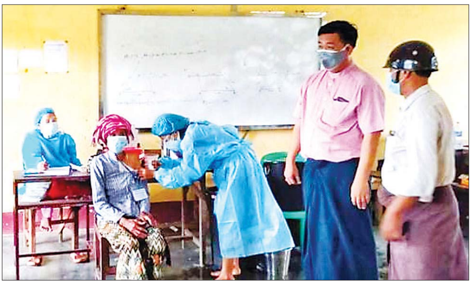
ဥက္ကဋ္ဌဦးဇေယျမင်းနှင့် တာဝန်ရှိ များကို လိုက်လံကြည့်ရှု၍ လျက်ရှိကြောင်း သိရသည်။ သူများက ဆေးထိုးနှံနေမှု အားပေးကူညီမှုများ ဆောင်ရွက် မြို့နယ် (ပြန်/ဆက်)

သီလရှင်များ လာရောက်ထိုးနှံ ကြကြောင်း သိရသည်။ ကျပ်ပျော်မြို့နယ်တွင် ဆေးထိုး စုရပ်အဖြစ် မြို့မတိုက်နယ်၌ အ.ထ.က(၁) နှင့် အ.ထ.က (၂) တို့တွင် လည်းကောင်း၊ ရေစခန်း၊ အထောင်၊ အင်းရဲ၊ ဒိုက်ပျက် စသည့် တိုက်နယ်များတွင် သက်ဆိုင်ရာ အထက်တန်း ကျောင်းအသီးသီးတွင် လည်း ကောင်း၊ ဆေးထိုးစုရပ်များ ဖွင့်လှစ်ကာ ထိုးနှံပေးလျက်ရှိ ကြောင်း၊ ဆေးထိုးနှံမှု စနစ်တကျ ရှိစေရန်အတွက် ကာကွယ်ဆေး ထိုး စီစဉ်ကြီးကြပ်ရေးအဖွဲ့များ က ကူညီဆောင်ရွက်လျက်ရှိပြီး မြို့နယ် စီမံအုပ်ချုပ်ရေးအဖွဲ့