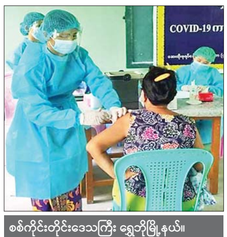
စစ်ကိုင်းတိုင်းဒေသကြီး ရွှေဘိုမြို့နယ်။ ခရိုင်(ပြန်/ဆက်)