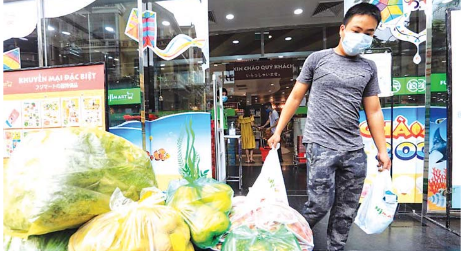
ဟန့်ရှင်းမြို့၌ ဈေးဆိုင်အတွင်းမှထွက်လာသည့် ဝယ်သူတစ်ဦးကို တွေ့ရစဉ်။

ကူးစက်မှု ပြင်းထန်နေသည့် အတွက် ဟိုချီမင်းမြို့တွင် ဇူလိုင် ၂၆ ရက်မှစတင်ကာ သတ်မှတ် ချိန်အတွင်း အပြင်မထွက်ရအမိန့် ထုတ်ပြန်ထားသည်။ ညနေ ၆ နာရီမှ နံနက် ၆ နာရီအထိ အပြင်ထွက် သွားလာမှုများကို ကန့်သတ်ထားသည်။ ဟန့်ရှင်း မြို့တွင်လည်း တင်းကျပ်သည့် လူမှုဝေးကွာ အစီအစဉ်များ ချမှတ်ထားပြီး နေအိမ်၌သာနေ ရန် အမိန့်ထုတ်ထားသည်။ ထို့ပြင် ဆင်ဟွာ