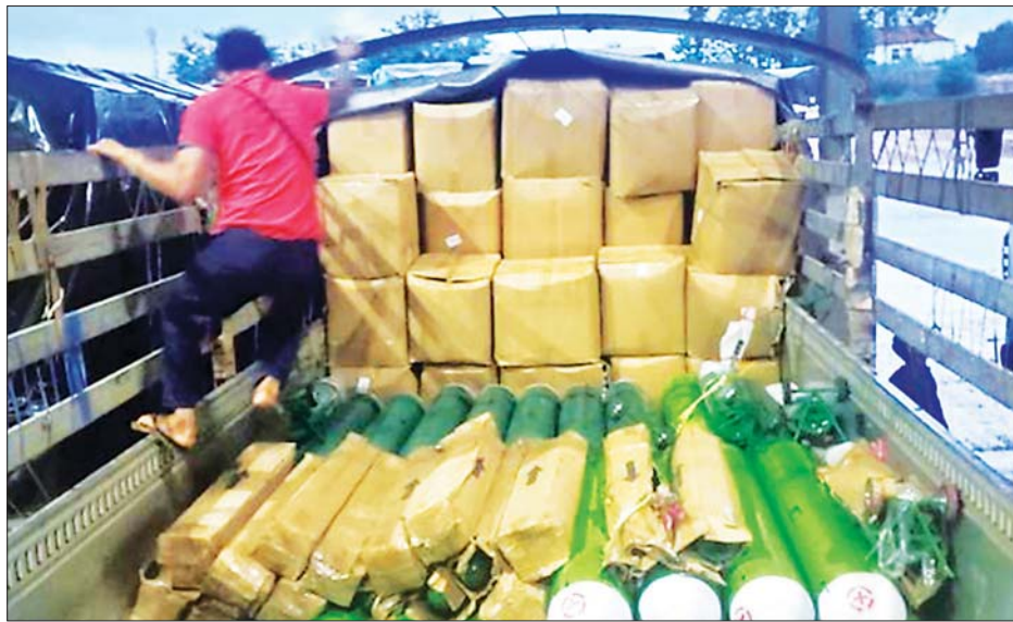
ကိုဗစ်-၁၉ ကာကွယ်၊ ထိန်းချုပ်၊ ကုသရေးဆိုင်ရာ ဆေးဝါးနှင့် ဆက်စပ်ပစ္စည်းများ မြဝတီနယ်စပ်ဂိတ် မှတစ်ဆင့် မော်တော်ယာဉ်များဖြင့် သယ်ဆောင်လာစဉ်။

တစ်နိုင်ငံလုံး အတိုင်းအတာဖြင့် ကိုဗစ်-၁၉ ရောဂါ ကူးစက်ဖြစ်ပွားမှု စတင်မြင့်တက်လာသည့် ဇူလိုင် ၁၂ ရက်မှစ၍ ရောဂါ ကာကွယ်၊ ထိန်းချုပ်၊ ကုသရေးဆိုင်ရာ ဆေးဝါးနှင့်ဆက်စပ်ပစ္စည်းများကို ဦးစားပေး တင်သွင်းခွင့်ပြုပေးလျက်ရှိရာ အများ ပြည်သူ အလုပ်ပိတ်ရက်ရှည်အဖြစ် သတ်မှတ်ထား သည့် ကာလအတွင်း အဆင်ပြေချောမွေ့စွာ တင်သွင်းနိုင်ရေးအတွက် သက်ဆိုင်ရာဌာနများမှ တာဝန်ရှိသူများသည် ညှိနှိုင်းထားသည့် SOP များနှင့်