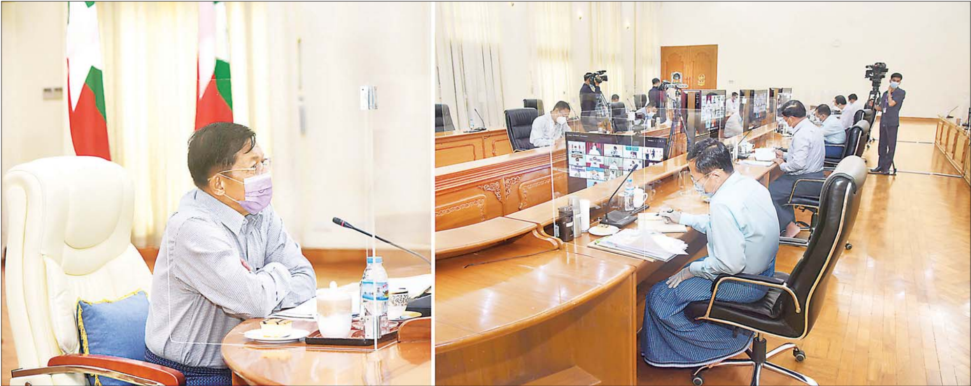
နိုင်ငံတော်စီမံအုပ်ချုပ်ရေးကောင်စီဥက္ကဋ္ဌ ဗိုလ်ချုပ်မှူးကြီး မင်းအောင်လှိုင် ကိုဗစ် - ၁၉ ရောဂါ ကာကွယ်၊ ထိန်းချုပ်၊ ကုသရေးဆိုင်ရာ ပဉ္စမအကြိမ် ညှိနှိုင်းအစည်းအဝေးတွင် အမှာစကားပြောကြားစဉ်။

၄။ တစ်နိုင်ငံလုံး ထာဝရငြိမ်းချမ်းရေးရရှိရေးအတွက် တစ်နိုင်ငံလုံး ပစ်ခတ်တိုက်ခိုက်မှု ရပ်စဲရေးသဘောတူစာချုပ် (NCA) ပါ သဘောတူညီချက်များအတိုင်း ဖြစ်နိုင်သမျှ အလေးထား လုပ်ဆောင်သွားမည်။ ၅။ အရေးပေါ်ကာလဆိုင်ရာ ပြဋ္ဌာန်းချက်များနှင့်အညီ ဆောင်ရွက်ပြီးစီးပါက ဖွဲ့စည်းပုံအခြေခံဥပဒေ (၂၀၀၈ ခုနှစ်) နှင့်အညီ လွတ်လပ်ပြီး တရားမျှတသော ပါတီစုံဒီမိုကရေစီအထွေထွေရွေးကောက်ပွဲအား ပြန်လည်ကျင်းပ၍ အနိုင်ရသည့်ပါတီအား ဒီမိုကရေစီစံနှုန်းများနှင့်အညီ နိုင်ငံတော်တာဝန်အား လွှဲအပ်နိုင်ရေး ဆက်လက်ဆောင်ရွက်သွားမည်။