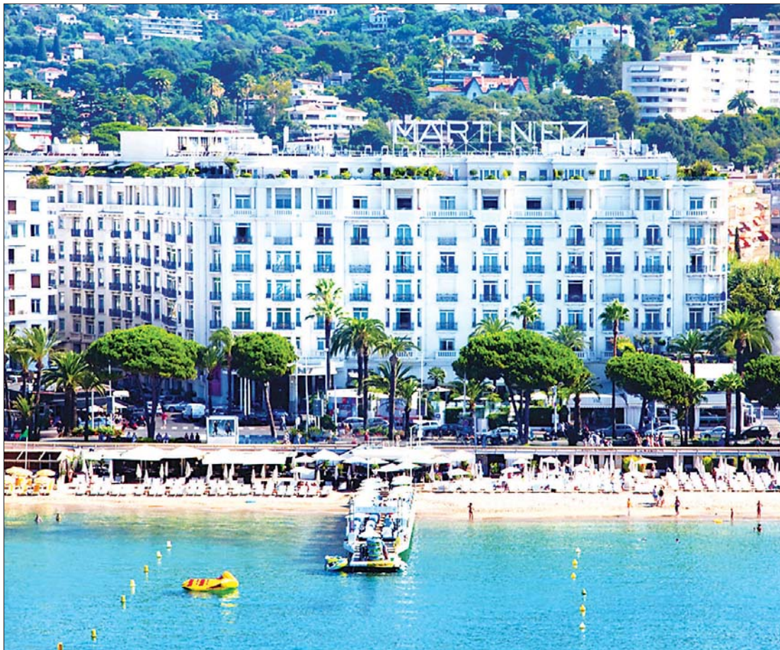
နာမည်ကြီး ဟိုတယ်တစ်ခုဖြစ်သော မာတီနက်စ်ဟိုတယ်။

ယင်းကန့်သတ်ချက်များကြောင့် ဝယ်ယူမှုများဆိုင်နှင့် ပိုမိုဝေးကွာသွားစေနိုင်သည်။ သို့သော်လည်း ပြည်တွင်းခရီး