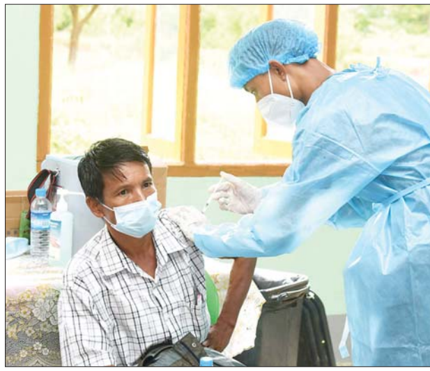
နေပြည်တော်ရှိ ဌာနဆိုင်ရာဝန်ထမ်းများအား ကိုဗစ်-၁၉ ကာကွယ်ဆေး ထိုးနှံပေးစဉ်။

ပြည်သူတွေ အကုန်လုံးလည်း ကာကွယ်ဆေးထိုးခွင့်ရပြီ ဆိုတာ နဲ့ မပျက်မကွက်ထိုးနှံကြဖို့ တိုက်တွန်းလိုပါတယ်” ဟု ပြောသည်။