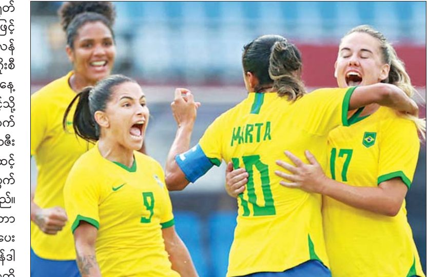
ဘရာဇီးအမျိုးသမီးအသင်း။

ဘရာဇီးအသင်းသည် ပွဲစဉ် (၁) တွင် တရုတ်အသင်းနှင့် ယှဉ်ပြိုင်ကစားခဲ့ပြီး ငါးဂိုး-ဂိုးမရှိဖြင့် အနိုင် ရရှိထားသည်။ ပွဲစဉ် (၂) တွင် နယ်သာလန်အသင်းနှင့် ယှဉ်ပြိုင်ကစားခဲ့ကာ တစ်ဖက်သုံးဂိုးစီ သရေကျခဲ့သည်။ ဘရာဇီးအသင်းသည် ယနေ့ပွဲစဉ်တွင် သရေကျရုံဖြင့် နောက်တစ်ဆင့်သို့ တက်ရောက် နိုင်ဖွယ်ရှိနေသည်။ ပြိုင်ဘက် ဇမ်ဘီယာအသင်းကလည်း ယနေ့ပွဲစဉ်တွင် ဘရာဇီးအသင်းကို အနိုင်ရရှိခဲ့ပါက နောက်တစ်ဆင့် တက်ရောက်ရန် အခွင့်အရေး ရှိနေသည့်အတွက် အသင်းကို အကောင်းဆုံးပြင်ဆင် လာဖွယ်ရှိနေသည်။ ဘရာဇီးအသင်းမှ ဝါရင့်တိုက်စစ်ကစားသမား မာတာသည် ပြီးခဲ့သည့်နှစ်ပွဲတွင် သုံးဂိုးအထိ သွင်းယူပေးထားနိုင်သည်။ ထို့ပြင် ဇမ်ဘီယာအသင်းမှ ဘန်ဒါကလည်း ပြီးခဲ့သည့် နှစ်ပွဲတွင် ခြောက်ဂိုးအထိ သွင်းယူပြီး ခြေစွမ်းပြသထားနိုင်သည်။ နယ်သာလန်အသင်းသည် အုပ်စု (F) တွင် ခြေစွမ်းပြသထားနိုင်သည့် အသင်းဖြစ်ပြီး ပြီးခဲ့သည့် နှစ်ပွဲတွင် ရဂိုး ၁၃ ဂိုးအထိရှိပြီး ပေးဂိုး ခြောက်ဂိုးသာရှိသည်။ ထို့အပြင် နယ်သာလန်အသင်းသည် ယနေ့ ပွဲစဉ်တွင် သရေတစ်မှတ်ရရှိဖြင့်