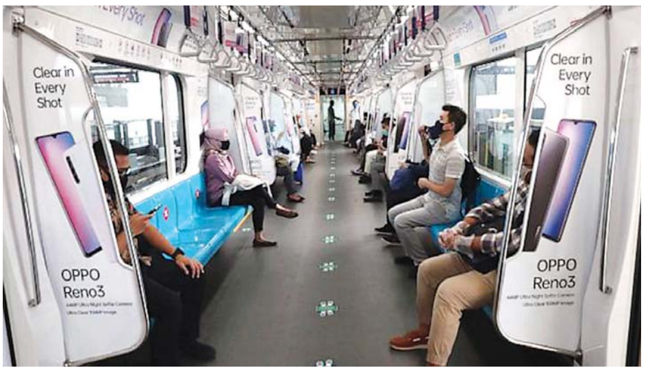
ဂျပာတာမြို့ရထားပေါ်တွင်လိုက်ပါလာကြသည့် ခရီးသည်များကို တွေ့ရစဉ်။

ကာ ယခုလို ထိန်းညှိမှုပြုလုပ်ပေးခဲ့ခြင်းဖြစ်သည်။ ဒယ်လီတာကူးစက်မှု တွေ့ရှိပြီးနောက် ဇူလိုင် ၃ ရက် တွင် ဂျပာစားနှင့်ဘာလီကျွန်းတို့တွင် ကန့်သတ်ချက် များထုတ်ပြန်ခဲ့သည်။ ကန့်သတ်ချက်များကြောင့် ကဏ္ဍအသီးသီးမှ ဝန်ထမ်းများ နေအိမ်မှသာ အလုပ်လုပ်ကိုင်ရန် ဖြစ်လာခဲ့သည်။ ဗိုင်းရပ်စ်ကူးစက်မှုမှာ ဆက်လက် ပျံ့နှံ့ဆဲဖြစ်ပြီး နေ့စဉ်ကူးစက်မှုများမှာလည်း ၃၀၀၀၀ မှ ၅၀၀၀၀ ကြားတွင် ရှိသည်။ ကိုဗစ်-၁၉ ကြောင့် သေဆုံးမှုများမှာလည်း ဆက်လက်များပြားနေဆဲဖြစ်သည်။ အင်ဒိုနီးရှားနိုင်ငံ ၏ကျန်းမာရေးစောင့်ရှောက်မှုစနစ်မှာ ကပ်ရောဂါ ကြောင့် အကျပ်အတည်းကြားတွင် ရင်ဆိုင်နေရ သည်။