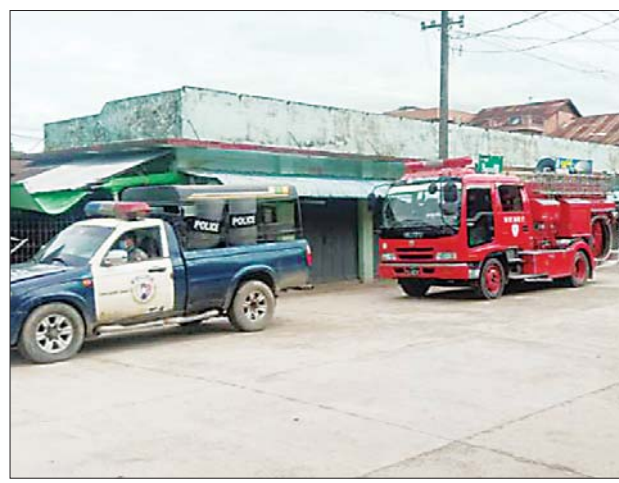
ကျောင်းကျွန်းမြို့နယ်တွင် ကိုဗစ်-၁၉ ရောဂါ ကူးစက်ပြန့်ပွားမှု နေ့စဉ် မြင့်တက်လျက်ရှိသောကြောင့် ရောဂါကူးစက်မှု မခံရစေရေး အတွက် လိုက်နာရမည့်အချက်များအား ကိုဗစ်-၁၉ ထိန်းချုပ်၊ ကာကွယ်၊ ကုသရေးနှင့်အရေးပေါ်တုံ့ပြန်ရေးကော်မတီမှ ယနေ့နံနက် ပိုင်းတွင် လိုက်လံအသိပေး နှိုးဆော်ကြစဉ်။