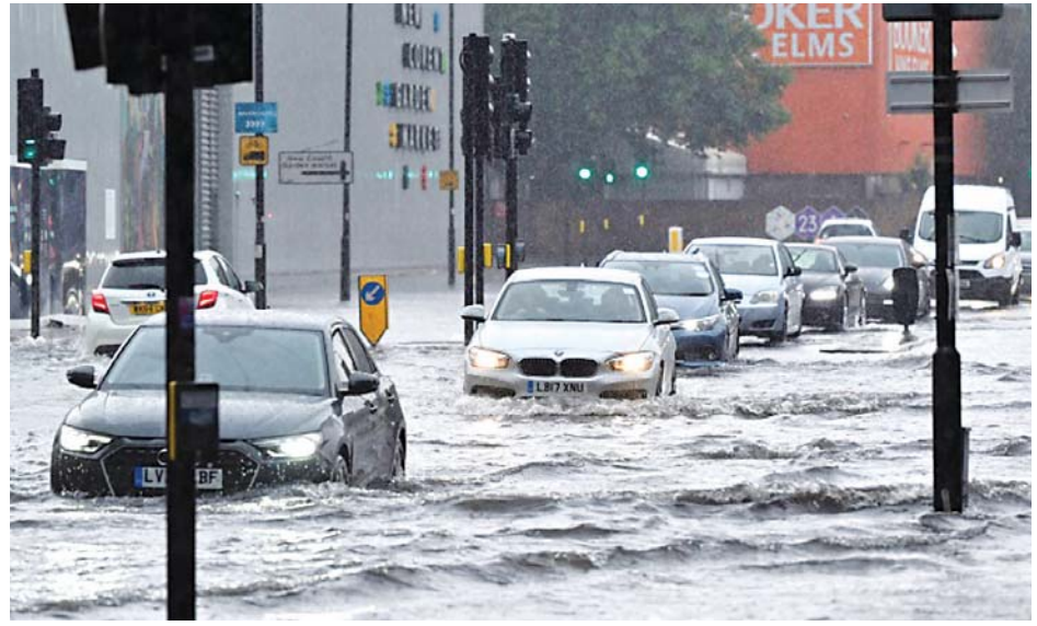
လန်ဒန်မြို့လမ်းများတွင် ရေကြီးမှုကြောင့် ကားများပိတ်မိနေသည်ကို တွေ့ရစဉ်။

များဖြစ်ပေါ်ခဲ့ရာ ဇူလိုင် ၂၅ ရက် တွင် လမ်းများထက်တွင် ရေလျှံ မှု ဖြစ်ပွားပြီး ကားများနှင့် ဘတ်စ်ကားများ ပိတ်မိနေသည် ဟု သိရသည်။ အရေးပေါ် ဝန်ဆောင်မှု ဌာနသည်လည်း လန်ဒန်မြို့ တစ်လွှား ရေလွှမ်းမိုးမှုအတွက်