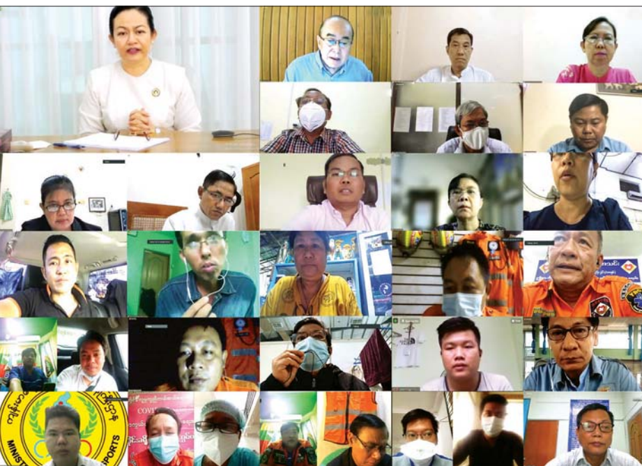
ကိုဗစ်-၁၉ ရောဂါ ကာကွယ်၊ ထိန်းချုပ်၊ တုံ့ပြန်ရေး လုပ်ငန်းစဉ်များ၌ ပူးပေါင်းပါဝင်ဆောင်ရွက်နေကြ သော စေတနာ့ဝန်ထမ်းများ၏ လိုအပ်ချက်များ ဖော်ထုတ်ဆွေးနွေးခြင်းကို Online ဖြင့် ကျင်းပစဉ်။

ဆက်လက်ပြီး ဒုတိယဝန်ကြီးက ပရဟိတအဖွဲ့ များသည် ပြည်သူလူထုနှင့် ထိတွေ့နေသူများ ဖြစ်