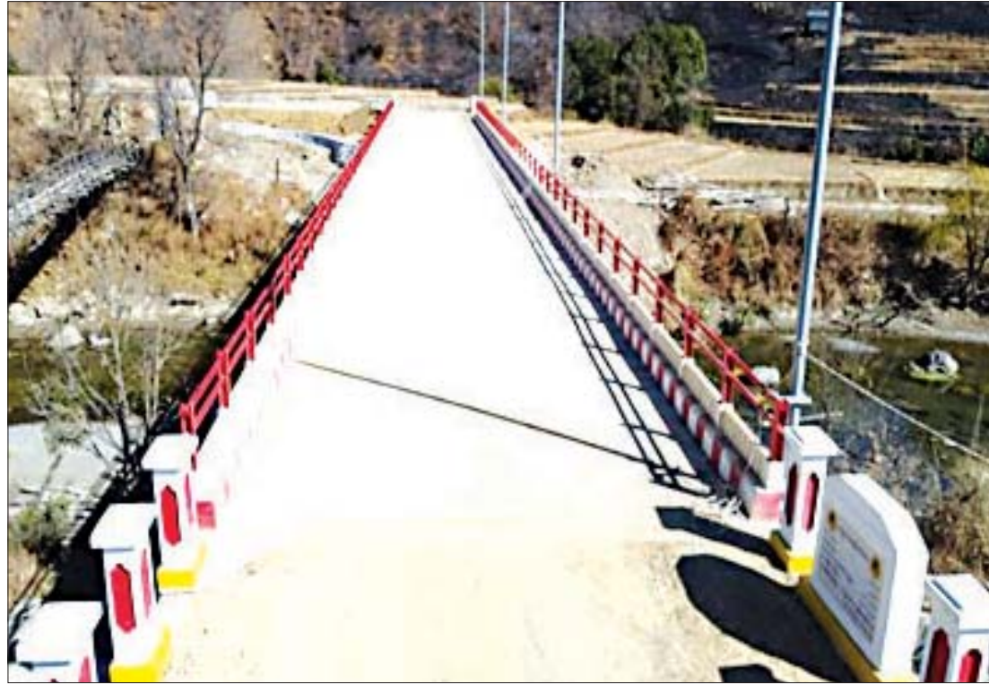
ဟားခါးခရိုင် ဟားခါးမြို့နယ် ကျေးလက်လမ်းဖွံ့ဖြိုးရေးဦးစီးဌာနမှ ဆောင်ရွက်သည့် လောက်လုံ-လီချားလမ်းပေါ်ရှိ ဘွေကူးဗားမြစ်ကူး ကွန်ကရစ်တံတားကို တွေ့ရစဉ်။

တီးတိန်မြို့နယ် တီးတိန်-သိုင်းငင်းလမ်း ၂၅ ကီလိုမီတာ-၂၆ ကီလိုမီတာမှ မှ တီးဆောက်-တီးဗျဲလ်-ဆောင်းဒေါ-ဒေါလွင်-မွာလ်ဇန်-ထန်ဆန်-မွာလ်နွမ်း(ဒီ)လမ်း ဖိုဇန်အဝင်ရှိ ပလာတာချောင်းကူးကွန်ကရစ်တံတား ပေ ၃၆၀ သည်လည်း ၂၀၂၀-၂၀၂၁ ဘဏ္ဍာနှစ်တွင် စတင်တည်ဆောက်ပေးနိုင်ခဲ့ပြီး ၂၀၂၂-၂၀၂၃ ဘဏ္ဍာနှစ်တွင် အပြီးတည်ဆောက်ပေးသွားမည် ဖြစ်သည်။ ယင်းတံတားသည် တီးတိန်မြို့နယ်နှင့် ကလေးမြို့နယ်ကို ဆက်သွယ်ပေးမည့် တံတားဖြစ်သည်။