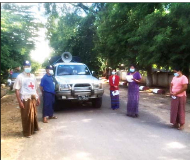
ကန်မြို့နယ်တွင် ဇူလိုင် ၂၆ ရက်က ဌာနဆိုင်ရာများ ပူးပေါင်း၍ ကျန်းမာရေးနှင့် အားကစားဝန်ကြီးဌာနမှ ထုတ်ပြန်ထားသည့် ကိုဗစ်-၁၉ ရောဂါ ကြိုတင်ကာကွယ်ရေးဆိုင်ရာများ အသိပညာပေး ဆောင်ရွက်ကြစဉ်။