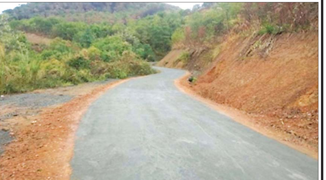
ဟားခါးခရိုင် ထန်တလန်မြို့နယ် ကျေးလက်လမ်းဖွံ့ဖြိုးရေးဦးစီးဌာနမှ ဆောင်ရွက်သည့် ဟရိခန်း-သီကိရ်-မွန်ဟာရ်- ဘုန်တလန် ကျေးလက်ကတ္တရာလမ်းအား တွေ့ရစဉ်။

■ ကျေးလက်လမ်း ဖွံ့ဖြိုးရေးဦးစီးဌာန၏ မဟာဗျူဟာရည်မှန်းချက်ဖြစ်သော ၂၀၃၀ ပြည့်နှစ်တွင် မြန်မာနိုင်ငံရှိ ကျေးရွာများ အားလုံး ၈၀ ရာခိုင်နှုန်းနှင့် နိုင်ငံတွင်းရှိ ကျေးလက်လူဦးရေ၏ ၉၀ ရာခိုင်နှုန်း အပေါ် ရာသီမရွေးသွားလာနိုင်သော ကျေးလက် လမ်းအဖြစ် အသုံးပြုနိုင်ရန် ချင်းပြည်နယ် ကျေးလက်လမ်းဖွံ့ဖြိုးရေးဦးစီးဌာနအနေ ဖြင့် အကောင်အထည်ဖော် ဆောင်ရွက် လျက်ရှိ