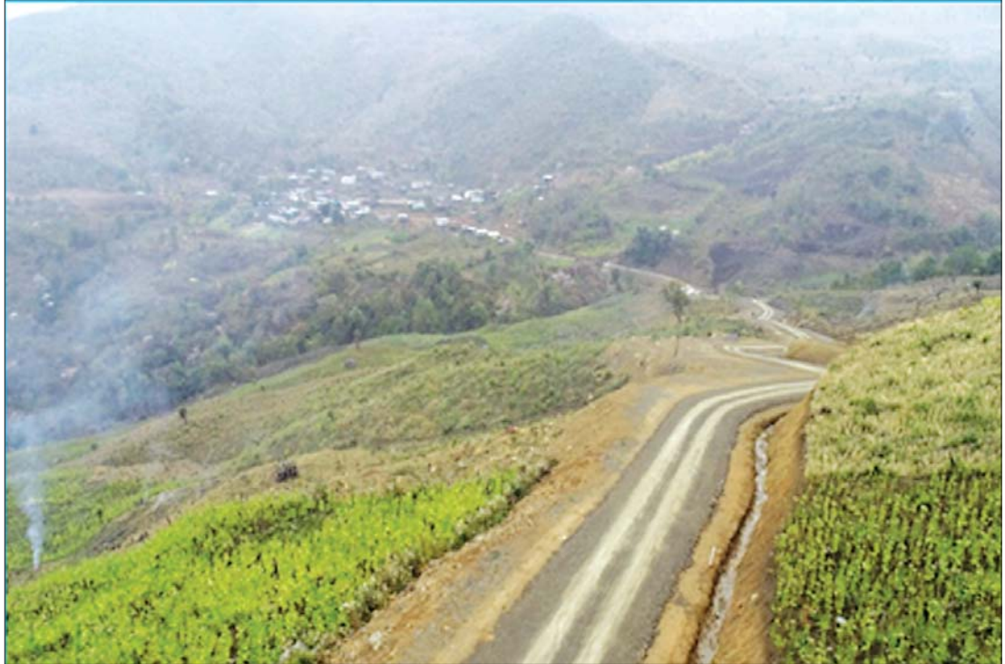
ဖလမ်းခရိုင် ဖလမ်းမြို့နယ် ကျေးလက်လမ်းဖွံ့ဖြိုးရေးဦးစီးဌာနမှ ဆောင်ရွက်သည့် ဆအက်-သီးကျိရ်-မွန်လွှာ-ကြော့သဲ-လျန်နာ-ရိဒ် ကျေးလက်ကျောက်ခင်းလမ်းကို တွေ့ရစဉ်။

တီးတိန်မြို့နယ်တွင် ဆောင်ရွက်ပေးလျက်ရှိသည့် ဇောင်ကောင်-လေးချေ-မွာလ်ဘင်းလမ်းသည် (၂၆/၀) မိုင်ရှိပြီး ယင်းလမ်းသည် နယ်ချဲ့မြေတိုက်အား ချင်းအမျိုးသားတို့၏ ခုခံတွန်းလှန်သည့်