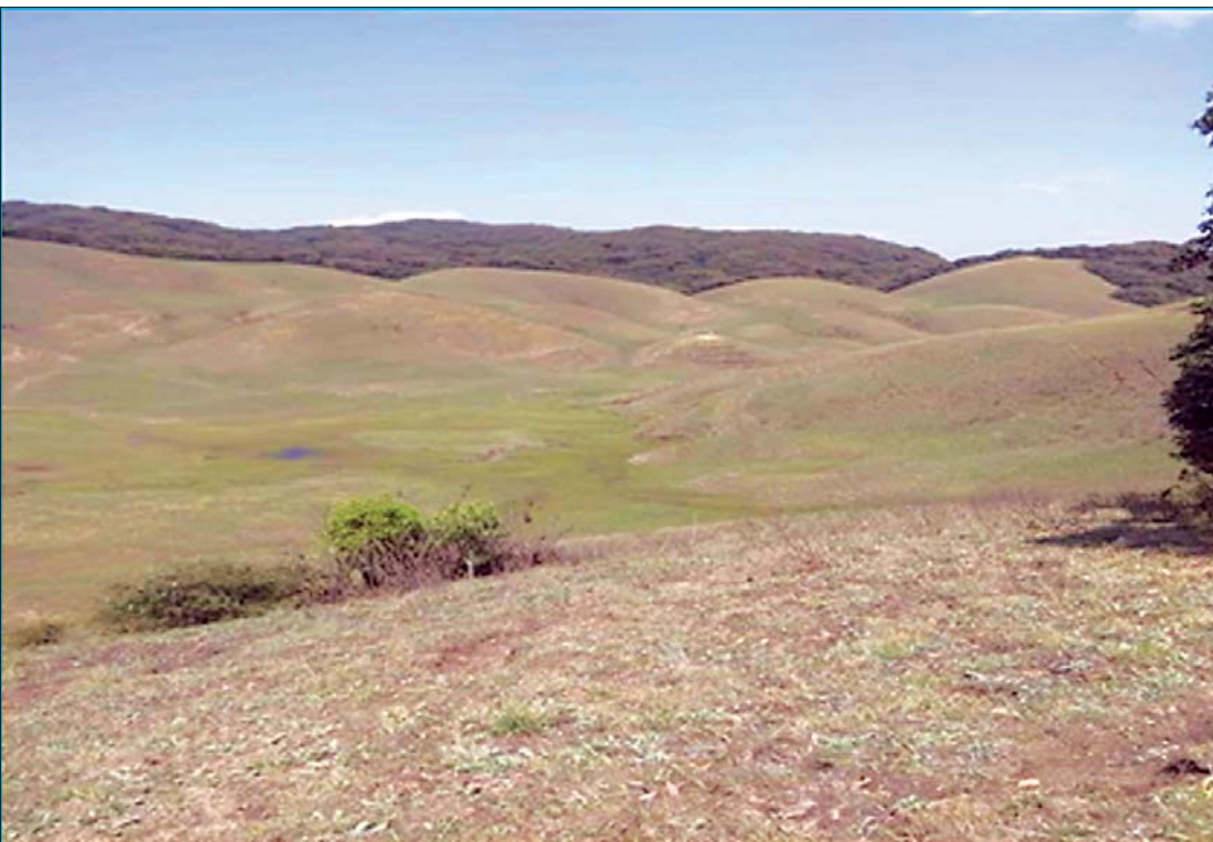
ဖလမ်းခရိုင် တီးတိန်မြို့နယ်ရှိ လင်နူးပါး(ခေါ်) ဘွလ်နဲလ်(ခေါ်) ရှုခင်းသာတောင်အား တွေ့ရစဉ်။

ချင်းပြည်နယ်သည် တောင်ကုန်း တောင်တန်းများ လွန်စွာထူထပ်ပြီး ချင်းတိုင်းရင်းသားတို့၏ ရိုးရာဓလေ့ ထုံးစံ၊ ယဉ်ကျေးမှုအရ ထိုတောင်တန်း များပေါ်တွင် ပြန့်ကျဲ၍ နေထိုင်လေ့ရှိ ကြပါသည်။ မြို့ပေါ်နေထိုင်သူဦးရေ ၃၀ ရာခိုင်နှုန်းခန့်နှင့် ကျေးလက်ဒေသတွင် နေထိုင်သူဦးရေ ၇၀ ရာခိုင်နှုန်းခန့် ရှိကြ ပါသည်။ ကျေးလက်နေပြည်သူများ၏ လမ်းပန်းဆက်သွယ်ရေး ကောင်းမွန် အောင် ဆောင်ရွက်နိုင်ရေးအတွက် ချင်းပြည်နယ် ကျေးလက်လမ်းဖွံ့ဖြိုး ရေးဦးစီးဌာနကို ၂၀၁၇ခုနှစ် ဇူလိုင်လ ၁ ရက်နေ့တွင် စတင်ဖွဲ့စည်းခဲ့ပါသည်။ ဤသို့ဖွဲ့စည်းမှုမတိုင်မီ ယခင်က ချင်းပြည်နယ်အတွင်း ကျေးလက်လမ်း များကို ကျေးလက်ဒေသဖွံ့ဖြိုးတိုးတက် ရေးဦးစီးဌာနနှင့် နယ်စပ်ဒေသနှင့် တိုင်းရင်းသားလူမျိုးများ ဖွံ့ဖြိုးတိုးတက် ရေးဦးစီးဌာနတို့က နယ်မြေဒေသ ပိုင်းခြား၍ဆောင်ရွက်ခဲ့ကြရာ ကျေးလက် လမ်းဖွံ့ဖြိုးရေးဦးစီးဌာန အနေဖြင့် ကျေးလက်ဒေသ ဖွံ့ဖြိုးတိုးတက်ရေး ဦးစီးဌာနက ဆောင်ရွက်ခဲ့သည့် လမ်း များကို လွှဲပြောင်းရယူ၍ ဆောင်ရွက်ခဲ့ပါ သည်။