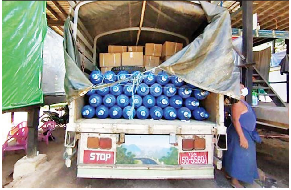
ကိုဗစ်-၁၉ ကာကွယ်၊ ထိန်းချုပ်၊ ကုသရေးဆိုင်ရာ ဆေးဝါးနှင့် ဆက်စပ်ပစ္စည်းများ ချင်းရွှေဟော်နယ်စပ်ဂိတ် မှတစ်ဆင့် မော်တော်ယာဉ်များဖြင့် သယ်ဆောင်လာစဉ်။

စီးပွားရေးနှင့် ကူးသန်းရောင်းဝယ်ရေးဝန်ကြီး ဌာနအနေဖြင့် ကိုဗစ် - ၁၉ ကူးစက်ရောဂါ ကာကွယ် ကုသရေးပစ္စည်းများ တင်သွင်းရာတွင် လွယ်ကူ မြန်ဆန်စေရေးအတွက် သက်ဆိုင်ရာဌာနများနှင့် ပူးပေါင်းဆောင်ရွက်လျက်ရှိသလို အကူအညီလိုအပ် ပါကလည်း သက်ဆိုင်ရာတာဝန်ရှိသူများထံ တိုက်ရိုက် ဆက်သွယ်နိုင်ရေးအတွက် ဌာနများ အလိုက် ဆက်သွယ်မေးမြန်းနိုင်သည့် တာဝန်ခံ (Contact Person) များနှင့် အသိပေးကြေညာချက် များကိုလည်း ဝန်ကြီးဌာန Website ဖြစ်သည့် Commerce.gov.mm တွင် ဝင်ရောက်ကြည့်ရှုနိုင်ရေး စီစဉ်ဆောင်ရွက်ပေးထားကြောင်း သိရသည်။ သတင်းစဉ်