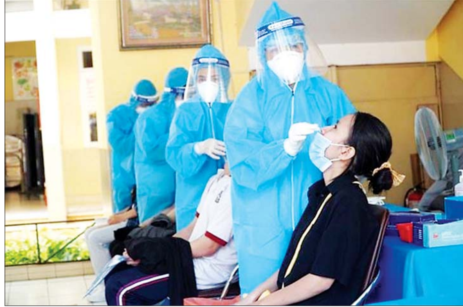
ဗီယက်နမ်နိုင်ငံတွင် ကိုဗစ်-၁၉ ဆေးစစ်မှုများ လုပ်ဆောင်ပေးနေစဉ်။

ဘင်ဒွန်ပြည်နယ်မှဖြစ်ပြီး ဖျူယန် ပြည်နယ်မှ ၃၇ ဦးကူးစက်ခံရသည် ဟု သိရသည်။ ကူးစက်မှုထဲမှ အများစုမှာ ယခင်အတည်ပြု လူနာများနှင့် ထိတွေ့မှုရှိသူများ သို့မဟုတ်ဒေသတွင်းအစုလိုက် ကူးစက်မှုများထဲတွင် ပါဝင်သူများ နှင့် ဆက်စပ်မှုရှိသူများ ဖြစ်ကြ သည်။ ဗီယက်နမ်နိုင်ငံတွင် ကိုဗစ် - ၁၉ ကူးစက်ခံရပြီးနောက် ပြန်လည် ကျန်းမာလာသူ စုစုပေါင်းမှာ ၇၆၄၃ ဦးဖြစ်ပြီး ဇွန် ၂ ရက်ကလည်း ၂၄၈ ဦး ပြန်လည် ကျန်းမာလာသည်ဟု သိရသည်။ ဇူလိုင် ၃ ရက်အထိ ဗီယက်နမ်နိုင်ငံ တွင် ပြည်တွင်းကူးစက်ခံရမှုပေါင်း ၁၇၁၉၉ ဦးရှိပြီး ၁၅၆၂၉ ဦးမှာ ရောဂါပြန်လည်ဖြစ်ပွားရာ ဧပြီလ နှောင်းပိုင်းမှ စတင်ကူးစက်ခံ ရခြင်း ဖြစ်သည်။ ဆင်ဟွာ