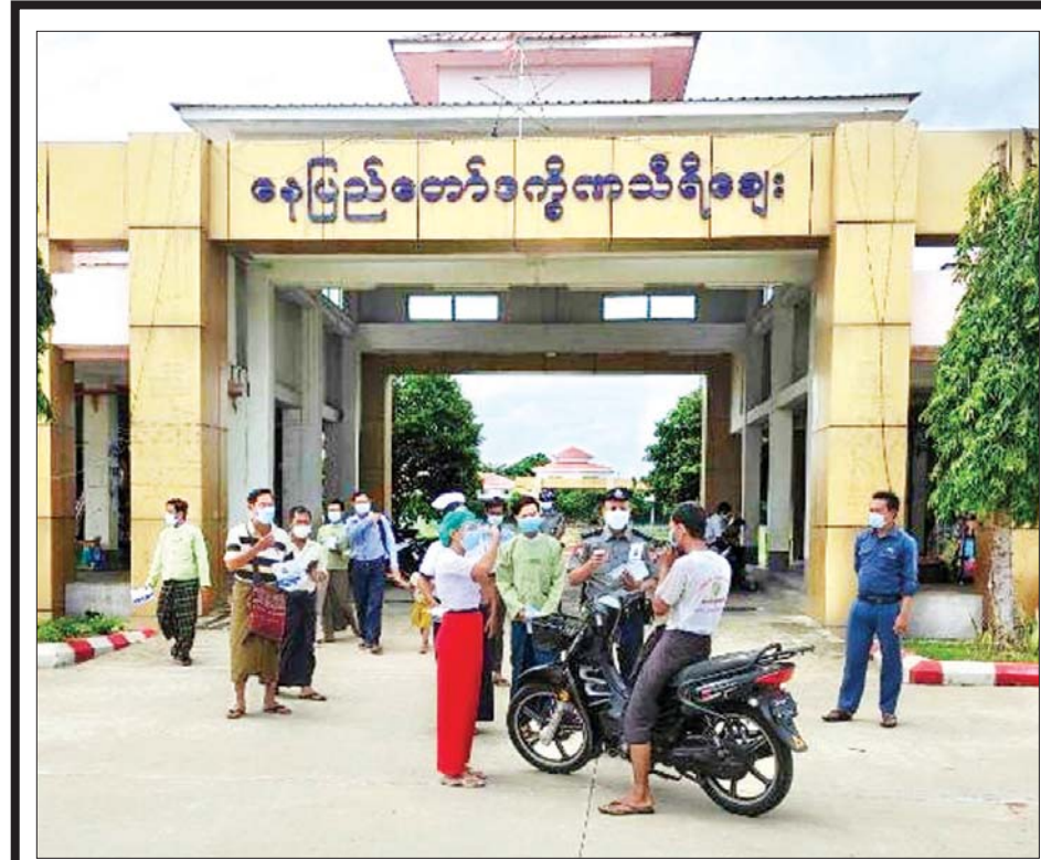
နေပြည်တော် ဒက္ခိဏသီရိဈေးတွင် ကိုဗစ်-၁၉ ရောဂါကာကွယ်ရေး ကျန်းမာရေး အသိပညာပေးခြင်းနှင့် ပါးစပ်နှင့် နှာခေါင်းစည်းအခမဲ့ ဖြန့်ဝေပေးစဉ်။ (သတင်း - ရှေ့ဖိုး)