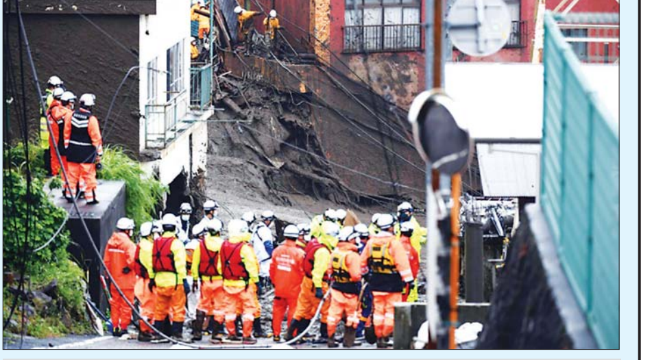
ကယ်ဆယ်ရေးလုပ်ငန်းများ ဆောင်ရွက်နေသည်ကို တွေ့ရစဉ်။

ချက်ထုတ်ပြန်ထားသည်။ အနိမ့် ပိုင်းဒေသများတွင် မိုးရေကြီးမှု နှင့် ရွံ့နှံ့ပြိုဆင်းမှုများဖြစ်ပေါ်နိုင် သည်ဟုလည်း သတိပေးချက် ထုတ်ပြန်ထားသည်။ ကယ်ဆယ်ရေး အချက် အလက်များကိုလည်း သတိပြု ကြရန် တိုက်တွန်းထားသည်။ တိုကျိုနှင့် အိုဆာကာကို ပြေးဆွဲ နေသည့် ရှင်ကန်ဆန် ကျည်ဆန် ရထားမှာလည်း ဇူလိုင် ၃ ရက်က ရပ်နားထားရသည်။ သို့သော် လည်း ယခုအခါ ပြေးဆွဲမှုများ ပြန်လည်ပြုလုပ်နေပြီဟု သိရ သည်။ အင်န်အိတ်ချ်ကေ