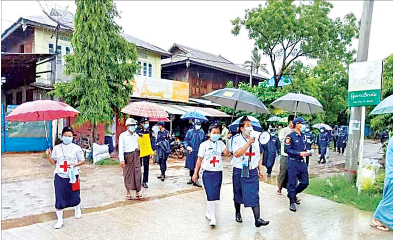
ပဲခူးတိုင်းဒေသကြီး၊ ပဲခူးမြို့အတွင်း ကိုဗစ်-၁၉ ရောဂါကာကွယ်ရေး ကျန်းမာရေးအသိပညာပေးခြင်း ဆောင်ရွက်နေမှုကို တွေ့ရစဉ်။

နေပြည်တော် ဇူလိုင် ၄ ကိုဗစ်-၁၉ ရောဂါကူးစက်ပြန့်ပွားမှုကို ထိရောက်စွာကာကွယ်၍ ရောဂါကွင်းဆက်များ ဖြတ်တောက်နိုင်ရန်အတွက် ကျန်းမာရေးနှင့် အားကစားဝန်ကြီးဌာနသည် ပါးစပ်နှင့် နှာခေါင်းစည်း (surgical mask) အရေအတွက်စုစုပေါင်း ၁၂၀၅၀၀၀ ခုကို နေပြည်တော်ကောင်စီနယ်မြေ၊ တိုင်းဒေသကြီးနှင့် ပြည်နယ် ပြည်သူ့ကျန်းမာရေးဦးစီးဌာနများထံသို့ ဇူလိုင်လအတွင်း ဖြန့်ဝေထားရှိပြီးဖြစ်ကြောင်း သိရသည်။ အဆိုပါ ပါးစပ်နှင့် နှာခေါင်းစည်း (surgical mask) များကို ကျန်းမာရေးနှင့်အားကစားဝန်ကြီးဌာန၏ လမ်းညွှန်မှုဖြင့် နေပြည်တော် ကောင်စီနယ်မြေ၊ တိုင်းဒေသကြီးနှင့် ပြည်နယ်နှင့် မြို့နယ် ပြည်သူ့ ကျန်းမာရေးဦးစီးဌာနများသည် ရောဂါကူးစက်နိုင်ခြေမြင့်မားသော လူစည်ကားရာနေရာများဖြစ်သည့် မြို့နယ်အသီးသီးရှိ ဈေး၊ ဘဏ်၊ လမ်းဆုံ၊ ကားဂိတ်၊ မြို့အဝင်အထွက်ဂိတ် စသည့်နေရာများတွင် ဒေသဆိုင်ရာ အာဏာပိုင်အဖွဲ့အစည်းများ၊ နီးနယ်ဝန်ကြီးဌာနများ၊ မြန်မာနိုင်ငံ ကြက်ခြေနီအသင်း၊ မြန်မာနိုင်ငံ မိခင်နှင့်ကလေး စောင့်ရှောက်ရေးအသင်း၊ မြန်မာနိုင်ငံ အမျိုးသမီးရေးရာအဖွဲ့ချုပ်၊ စေတနာ့ဝန်ထမ်းများနှင့်ပူးပေါင်း၍ ရောဂါကာကွယ်ရေး ကျန်းမာရေး အသိပညာပေးခြင်းနှင့် ပါးစပ်နှင့် နှာခေါင်းစည်း အခမဲ့ဖြန့်ဝေပေးခြင်း (Mask Campaign) များ ဆောင်ရွက်လျက်ရှိကြောင်း သိရသည်။ သတင်းစဉ်