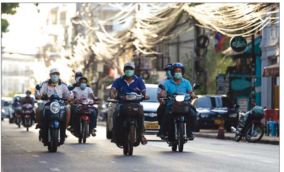
လာအိုနိုင်ငံ ဗီယက်ကျွန်းမြို့လမ်းမထက်တွင် ပါးစပ်၊ နှာခေါင်းစည်းတပ်ဆင်ကာ သွားလာကြသူများကို တွေ့ရစဉ်။

၁၉ ရက် မတိုင်မီအချိန်အထိ အသွားအလာပိတ်ဆို့ ကန့်သတ်မှုကိုပြုလုပ်မည်ဟု ပြောကြားခဲ့သည်။ ဒေသတွင်း ကိုဗစ် - ၁၉ ကူးစက်မှုများကို ထိန်းချုပ်နိုင်ရေးအတွက် ရည်ရွယ်ကာ အသွားအလာ ပိတ်ဆို့ကန့်သတ်မှုကို ပြုလုပ်ခဲ့ခြင်းဖြစ်သည်။ လက်ရှိချမှတ်ထားသည့် အသွားအလာပိတ်ဆို့ ကန့်သတ်မှုမှာ ဇွန် ၁၉ ရက်က စတင်ခဲ့ခြင်း ဖြစ်ပြီး ဇူလိုင် ၄ ရက်တွင် သက်တမ်းကုန်ဆုံးပြီ ဖြစ်သည်။ ပြီးခဲ့သည့် ၂၄ နာရီအတွင်း လာအိုနိုင်ငံတွင် ကိုဗစ် -၁၉ နောက်ထပ်ကူးစက်ခံရသူ ၃၂ ဦး တွေ့ရှိ ခဲ့ပြီး တစ်နိုင်ငံလုံးအနှံ့ စုစုပေါင်းကူးစက်ခံရသူ ၂၂၄၄ ဦး ရှိလာသည်။ ပြန်လည်ကျန်းမာ၍ ဆေးရုံမှ ဆင်းသွားသူအရေအတွက်မှာလည်း ၂၀၃၁ ဦး ရှိသည်ဟု သိရသည်။ ဆင်ဟွာ