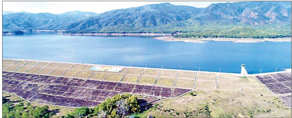
မန်းချောင်းရေလှောင်တံမံအတွင်း လက်ရှိရေဝင်ရောက်မှုအခြေအနေကို တွေ့ရစဉ်။