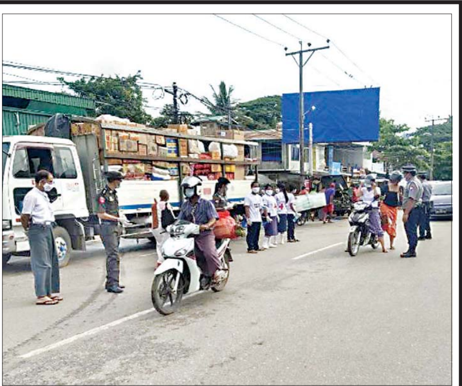
မွန်ပြည်နယ် သံဖြူဇရပ်မြို့နယ်၌ ကိုဗစ်-၁၉ ရောဂါကာကွယ်ရေး ကျန်းမာရေးအသိပညာပေးခြင်းနှင့် ပါးစပ်နှင့် နှာခေါင်းစည်း အခမဲ့ဖြန့်ဝေပေးစဉ်။ (သတင်း - ရှေ့ဖိုး)