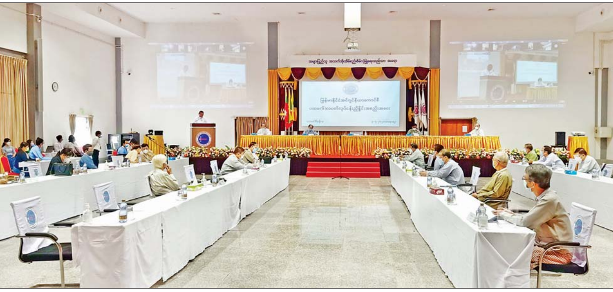
ဒုတိယအကြိမ် မြန်မာနိုင်ငံအင်ဂျင်နီယာကောင်စီ ပုံမှန်အစည်းအဝေး(၁/၂၀၂၁)ကို ကိုဗစ်-၁၉ ညွှန်ကြားချက်များနှင့်အညီ ကျင်းပစဉ်။

ယင်းနောက် မြန်မာနိုင်ငံ အင်ဂျင်နီယာကောင်စီ၏ ယနေ့ ကျင်းပသည့် ပထမ (၆) လပတ် ပုံမှန်အစည်းအဝေးတွင် လစ်လပ် သွားသော ကောင်စီဝင်တစ်ဦး၏နေရာ၌ နာယကကြီးများရှေ့မှောက် တွင်ကတိသစ္စာပြုခန့်ထားခြင်းနှင့် တွဲဖက်အတွင်းရေးမှူး(၁)အဖြစ် အတည်ပြုခန့်ထားခြင်းများဆောင်ရွက်ပြီး အစည်းအဝေး (ပထမပိုင်း) အစီအစဉ်ကို အောင်မြင်စွာ ကျင်းပပြီးစီးကာ အစည်းအဝေး