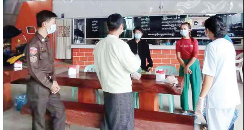
စားသောက်ဆိုင်တစ်ဆိုင်တွင် တာဝန်ရှိသူများ လိုက်လံစစ်ဆေးနေစဉ်