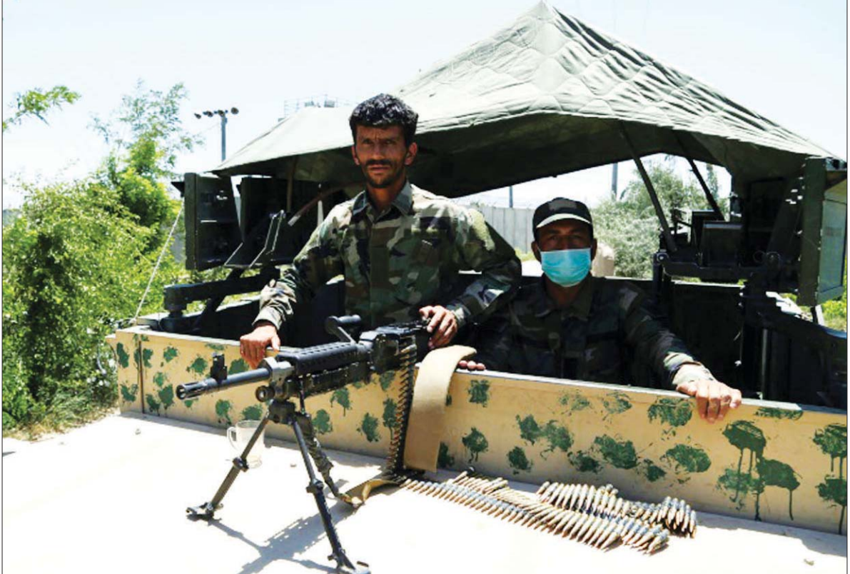
အမေရိကန်နှင့် နေတိုးတပ်ဖွဲ့ဝင်များ ဆုတ်ခွာသွားပြီးနောက် ဘာဂရမ်စခန်းတွင် အာဖဂန်တပ်ဖွဲ့ဝင်များ လုံခြုံရေးယူနေသည်ကို တွေ့ရစဉ်။

မကြာသေးမီရက်ပိုင်းအတွင်း အာဖဂန်လေတပ်သည် တာလီဘန်များ ပုန်းခိုရာနေရာများနှင့် သူပုန်များ နေထိုင်ရာနေရာများကို ပစ်မှတ်ထား၍ တိုက်ခိုက်မှုများ အပြင်အထန်ပြုလုပ်ခဲ့သည်။ တာလီဘန်များဘက်မှ သေကျဆုံးရှုံးမှုများစွာရှိသည်ဟု ဟယ်မန်းပြည်နယ်ကောင်စီမှ အဖွဲ့ဝင်တစ်ဦးက အေအက်ဖ်ပီသို့ ပြောသည်။ အာဖဂန်အစိုးရဘက်မှ ပြောကြားချက်ကို တာလီဘန်များက ငြင်းဆိုခဲ့သည်။ တစ်ဖက်နှင့် တစ်ဖက်သေဆုံးမှုများကို ချဲ့ကားပြောလေ့ရှိပြီး သေဆုံးသူ အတိအကျကို ဆုံးဖြတ်ရန်မူ ခက်ခဲသည်။ မေ ၁ ရက်မှ စတင်ကာ အမေရိကန်တို့ဘက်မှ တပ်ဖွဲ့ဝင် ၂၅၀၀ ကို အပြီး