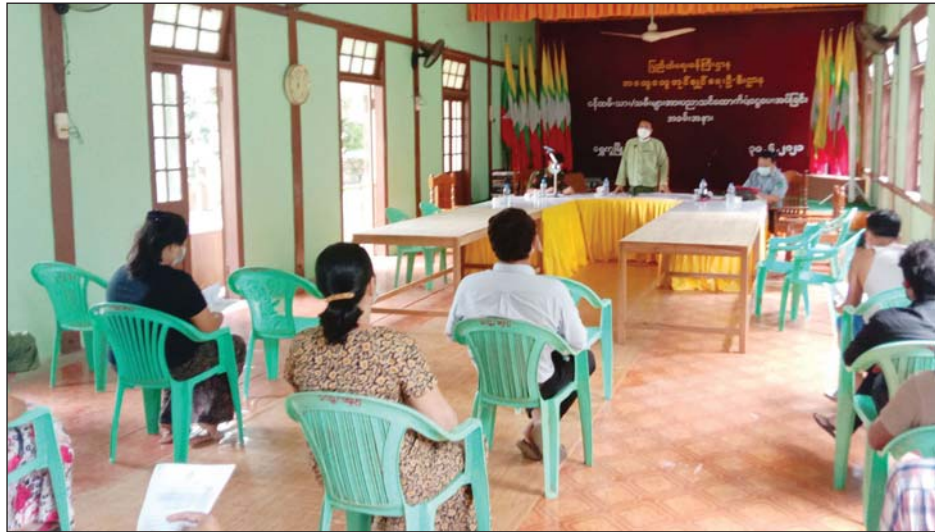
အစည်းအဝေးတွင် မြို့နယ်စီမံအုပ်ချုပ်ရေးအဖွဲ့ ဥက္ကဋ္ဌ အမှာစကားပြောကြားစဉ်

ဝန်ထမ်းများ လိုက်နာဆောင်ရွက်ရမည့်အချက်များ၊ ရွက်ရမည့်အချက်များ၊ လက်လီဈေးရောင်းချသူများ အနေဖြင့် လိုက်နာရန်နှင့် ဆိုင်တွင် ပြင်ဆင်ထားရှိရန်