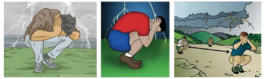
လွင်တီးခေါင်ပြင်တွင်ရှိစဉ် မိုးကြိုးအန္တရာယ်မှ ကာကွယ်ရန် နေထိုင်ရမည့်ပုံစံများ

မိုးကြိုးပစ်ခံရသောလူနာအား အရေးပေါ်ကယ်ဆယ်နည်းများပြုလုပ်ပြီး ဆေးရုံ/ဆေးခန်းများသို့ အမြန်ပို့ဆောင်ပါ။