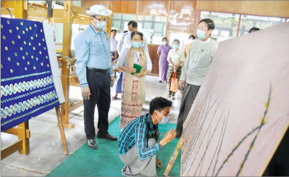
အထည်ပန်းပုံရိုက်နှင့် ဆေးရေးပန်းချီ ရေးဆွဲနေစဉ်။

“ဒါနဲ့ နေစမ်းပါဦး။ ဟိုတစ်နေ့က တီဗွီထဲ တွေ့လိုက်ပါတယ် ဆောင်းဒါးရက်ကန်း ကျောင်းဆိုတာ။ ဆောင်းဒါးဆိုတာ ဘာအဓိပ္ပာယ်လဲကွ။ ဆောင်းဒါးပဲ ကြားဖူးပါတယ်။ ဆောင်းဒါးဆိုတော့ ဆောင်းတွင်းမှာ ဒါးတွေထုတ်လို့ ဆောင်းဒါးလို့ ခေါ်တာလား။”