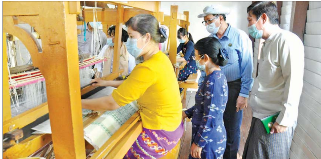
မြန်မာ့လက်ရက်ကန်း ရက်လုပ်နေစဉ်။

နဲ့ကို ငါတော့ နိုင်ငံတော်ကို အများကြီး ကျေးဇူးတင်သွားပြီကွာ။ ဒီလူကြီးတွေ ရည်ရွယ်ချက်ကောင်းကောင်းနဲ့ ကိုယ့် နိုင်ငံက ပြည်သူတွေ စားဝတ်နေရေး အဆင်ပြေအောင်၊ မိသားစုဝင်ငွေရရှိ အောင် ဘက်ပေါင်းစုံက လုပ်ပေးနေတာ။ အဲဒါကိုသိတဲ့လူတွေကတော့ အဲဒီ အကျိုးကို ခံစားနေရတာပေါ့။ ဒါနဲ့ မင်း ဆောင်းဒါအပြင် ကျန်တဲ့သင်တန်း ကျောင်းတွေရော ရောက်ဖူးသလား။ ဒီကိုဗစ်ကာလကြီးမှာ ကျောင်းတက်တဲ့ လူရော ရှိသလား။”