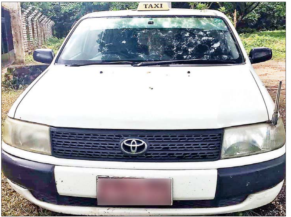
လက်နက်၊ ခဲယမ်းများ သယ်ဆောင်လာသူများ စီးနင်းလာသည့် မော်တော်ယာဉ်ကို တွေ့ရစဉ်။

နိုင်ခဲ့ပြီး ၎င်းတို့အား ဥပဒေအရ ထိရောက်စွာ အရေးယူနိုင်ရေး ဆောင်ရွက်သွားမည်ဖြစ်ကြောင်း နှင့် ဆက်စပ်တရားခံများအား ဆက်လက်ဖော်ထုတ်ဖမ်းဆီးသွား မည်ဖြစ်ကြောင်း သတင်းရရှိ သတင်းစဉ်