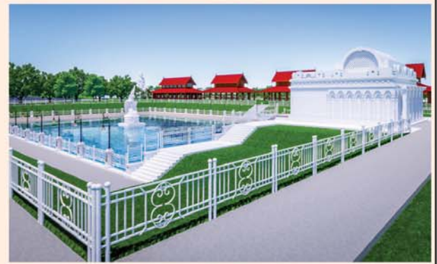
မုဝလိန္ဒအိုင်