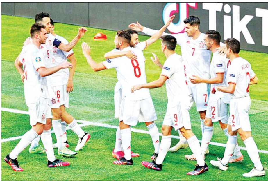
စပိန်အသင်းမှ ကစားသမားများကို တွေ့ရစဉ်။

ယူရို ၂၀၂၀ ပြိုင်ပွဲ ကွာတား ဖိုင်နယ်ပွဲစဉ်များကို ဇူလိုင် ၂ ရက် (ယနေ့) တွင်စတင်ယှဉ်ပြိုင်ကစား မည်ဖြစ်သည်။ ယနေ့ည ၁၀ နာရီ ခွဲတွင် ဆွစ်ဇာလန်အသင်းနှင့် စပိန်အသင်းတို့ ယှဉ်ပြိုင်ကစား မည်ဖြစ်ပြီး ဇူလိုင် ၃ ရက် နံနက် ပိုင်းတွင် ဘယ်လ်ဂျီယံအသင်းနှင့် အီတလီအသင်းတို့ ယှဉ်ပြိုင် ကစားမည် ဖြစ်သည်။