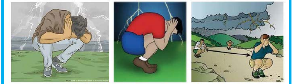
လွင်တီးခေါင်ပြင်တွင်ရှိစဉ် မိုးကြိုးအန္တရာယ်မှ ကာကွယ်ရန် နေထိုင်ရမည့်ပုံစံများ

မိုးကြိုးပစ်ခံရသောလူနာအား အရေးပေါ်ကယ်ဆယ်ရည်းများပြုလုပ်ပြီး ဆေးကု/ဆေးခန်းများသို့ အမြန်ပို့ဆောင်ပါ။