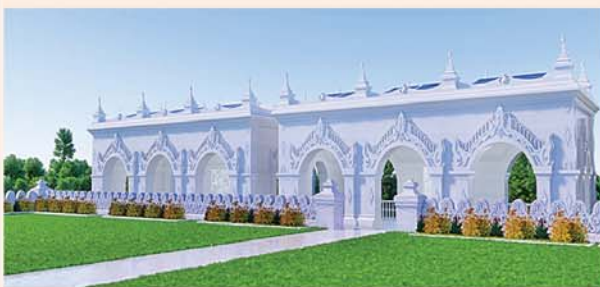
မြန်မာမှုစတုရန်းကျောက်ဖြင့် တည်ဆောက်ပူဇော်ထားသော ဂန္ဓကုဋ်တိုက် (၅၄x၂၇)ပေ ၂၄ လုံး ၁ လုံးလျှင်- ၁၂၅၀ သိန်း