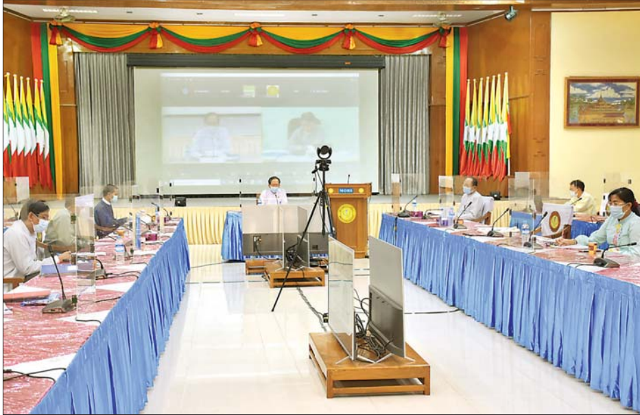
ပြည်ထောင်စုဝန်ကြီး ဒေါက်တာသက်ခိုင်ဝင်း ဗီဒီယိုကွန်ဖရင့်စနစ်ဖြင့် ကျင်းပသည့် ကိုဗစ်-၁၉ ရောဂါ ကာကွယ်ကုသရေး လုပ်ငန်း ညှိနှိုင်းအစည်းအဝေးတွင် အမှာစကားပြောကြားစဉ်။

နေပြည်တော် ဇူလိုင် ၁ ကိုဗစ်-၁၉ ရောဂါ ကာကွယ်ကုသရေး လုပ်ငန်း ညှိနှိုင်းအစည်းအဝေးကို ယနေ့နံနက် ၁၀ နာရီတွင် ကျန်းမာရေးနှင့်အားကစားဝန်ကြီးဌာန COVID-19 Command Center ၌ ဗီဒီယိုကွန်ဖရင့်စနစ်ဖြင့် ကျင်းပရာ ကျန်းမာရေးနှင့်အားကစားဝန်ကြီးဌာန ပြည်ထောင်စုဝန်ကြီး ဒေါက်တာသက်ခိုင်ဝင်း တက်ရောက်ဆွေးနွေးသည်။