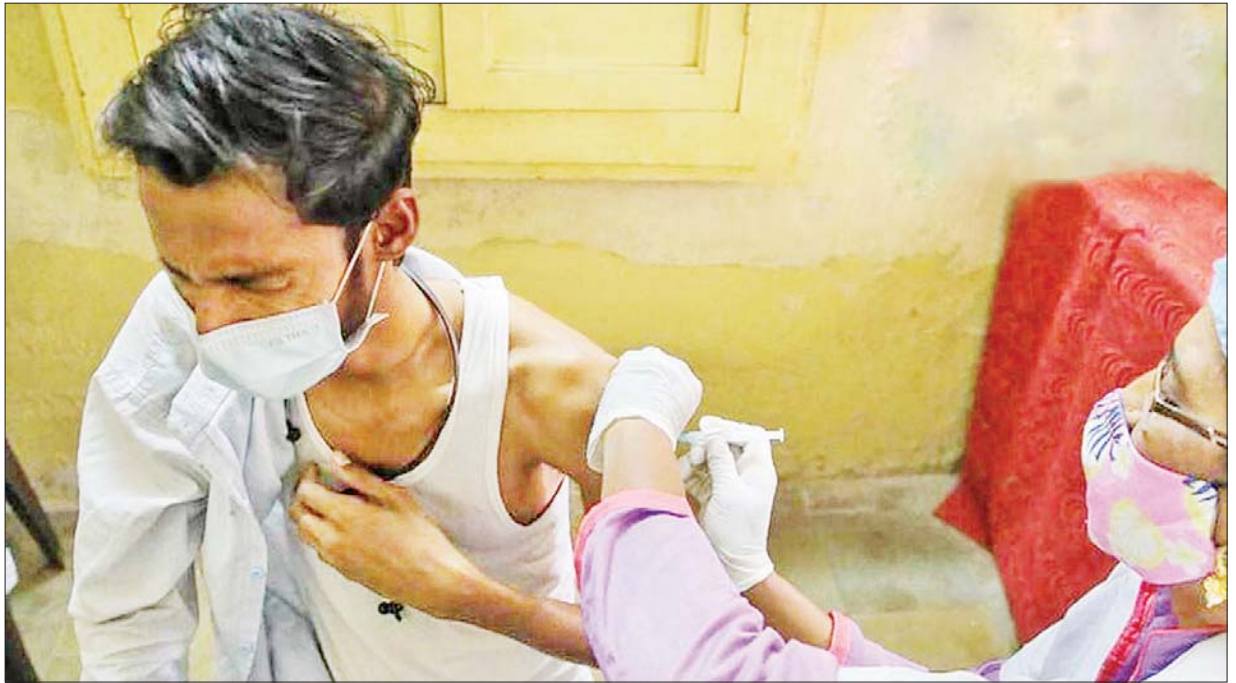
အိန္ဒိယနိုင်ငံတွင် ကျန်းမာရေးဝန်ထမ်းတစ်ဦးက ပြည်သူတစ်ဦးကို ကိုဗစ်-၁၉ ကာကွယ်ဆေး ထိုးပေးနေစဉ်။

နေ့စဉ် ကိုဗစ်-၁၉ ကူးစက်ဖြစ်ပွားမှုအရေအတွက် တဖြည်းဖြည်း ကျဆင်းခဲ့သော်လည်း သက်ဆိုင်ရာ တိုင်း၊ ခရိုင်၊ ပြည်နယ်အုပ်ချုပ်