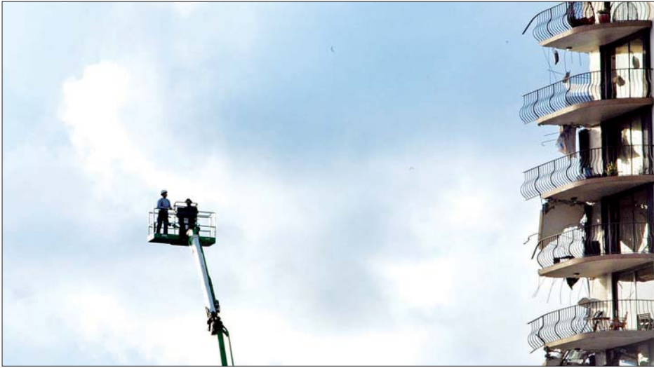
၁၂ ထပ် လူနေအဆောက်အအုံပြုကျပြီးနောက် ကယ်ဆယ်ရေးလုပ်ငန်းများ လုပ်ဆောင်နေသည်ကို တွေ့ရစဉ်။

သေဆုံးသွားသူများမှာ ကလေးနှစ်ဦးဖြစ်သည်ဆိုသည်ကို မိမိအနေဖြင့် အသိပေးပြောကြားရမည့်အတွက် တကယ့်ကို စိတ်မကောင်းဖြစ်မိပြီး တကယ့်ကို နာကျင်ရပါသည်ဟု ကာဗာက