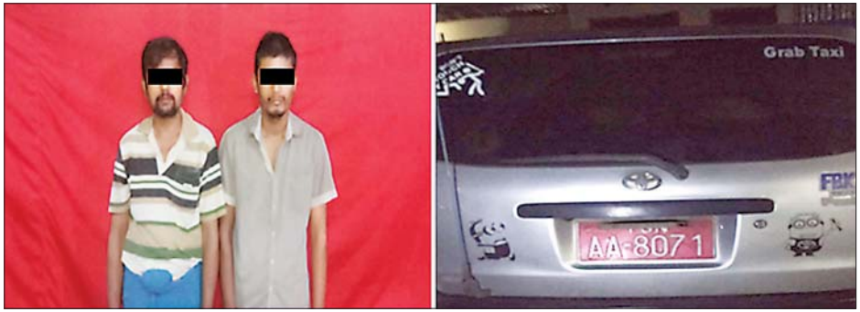
သန်လျင်မြို့နယ်၌ လက်လုပ်ဗုံးတစ်လုံးပေါက်ကွဲမှုမှ မသင်္ကာယာဉ်နှင့် အမျိုးသားနှစ်ဦးအား ထိန်းသိမ်းထားစဉ်။