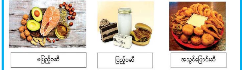
မပြည့်ဝဆီ ပြည့်ဝဆီ အသွင်ပြောင်းဆီ ရည်ညွှန်းကိုးကား-(၁) WHO. Healthy diet fact sheets. (accessed as of 10.6.2020) (၂) MAYO CLINIC. Dietary fats: Know which types to choose. (accessed as of 10.6.2020)

ပြည့်ဝဆီများကိုတတ်နိုင်သမျှလျှော့စား၍ အသွင်ပြောင်းဆီများစားသုံးခြင်းကိုလုံးဝရှောင်ကြဉ်ရမည်ဖြစ်ပါသည်။