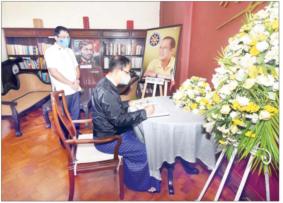
ခုနှစ်အထိ ဖိလစ်ပိုင်နိုင်ငံ၏ ၁၅ ထမ်းဆောင်ခဲ့ပြီး ယခုကွယ်လွန် ကြောင်း သိရသည်။ ဦးမြောက် သမ္မတအဖြစ် တာဝန် ချိန်တွင် အသက် ၆၁ နှစ်ရှိပြီ ဖြစ် သတင်းစဉ်