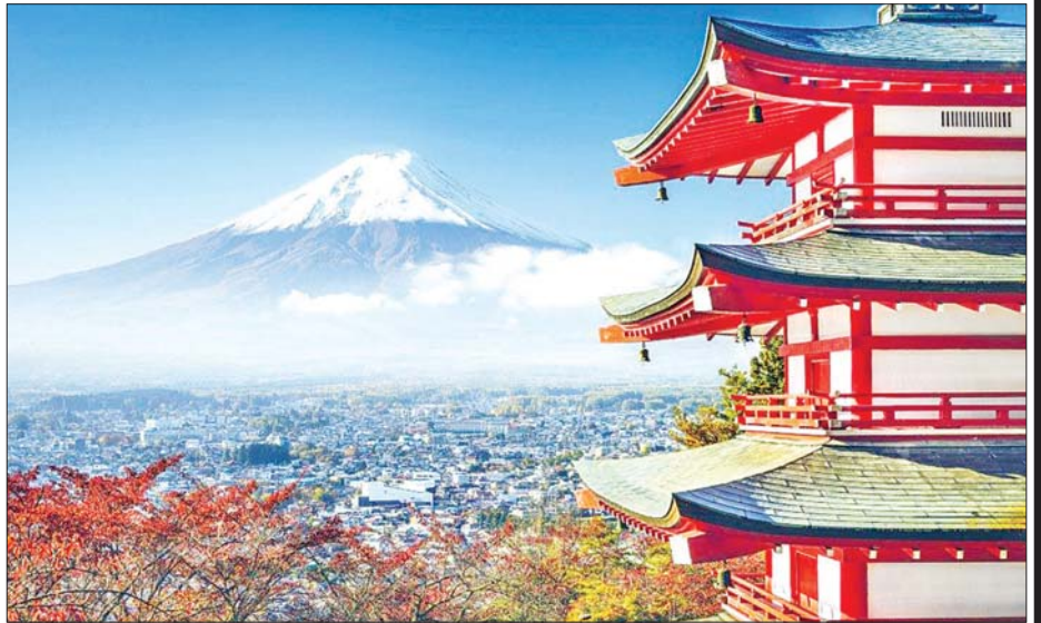
ဂျပန်နိုင်ငံရှိ ဖူဂျီတောင်ကို တွေ့ရစဉ်။