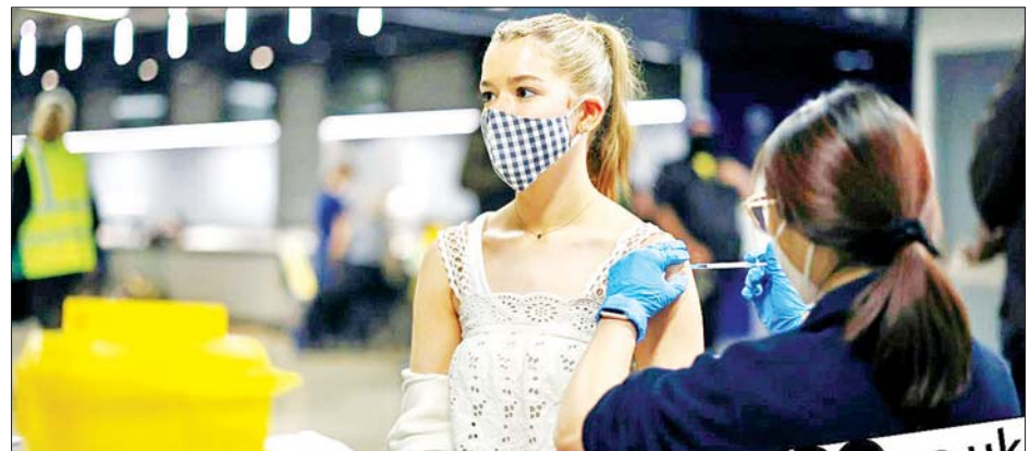
ဗြိတိန်တွင် ကျန်းမာရေးအာဏာပိုင်တစ်ဦးက အမျိုးသမီးငယ်တစ်ဦးကို ကိုဗစ်-၁၉ ကာကွယ်ဆေး ထိုးပေးနေစဉ်။

ဗြိတိန် ဇူလိုင် ၁ ဖြတ်နစ်အစိုးရသည် ဆောင်းတွင်းမတိုင်မီ ကိုဗစ်-၁၉ ကြောင့် ဖြစ်ပေါ်လာနိုင်သည့် ထိခိုက်နာကျင်မှုများကို ကာကွယ်နိုင်ရန် တတိယအကြိမ် ကိုဗစ်-၁၉ ကာကွယ်ဆေးများ ထိုးပေးသွားမည်ဖြစ်သည်။ ကိုဗစ်-၁၉ ကာကွယ်ဆေးကို ပိုမိုထိုးခြင်းဖြင့် ကိုဗစ်-၁၉ ကူးစက်ဖြစ်ပွားမှုကို ပိုမိုကြာကြာ ခုခံသွားနိုင်မည်ဖြစ်ကြောင်း အသွင်