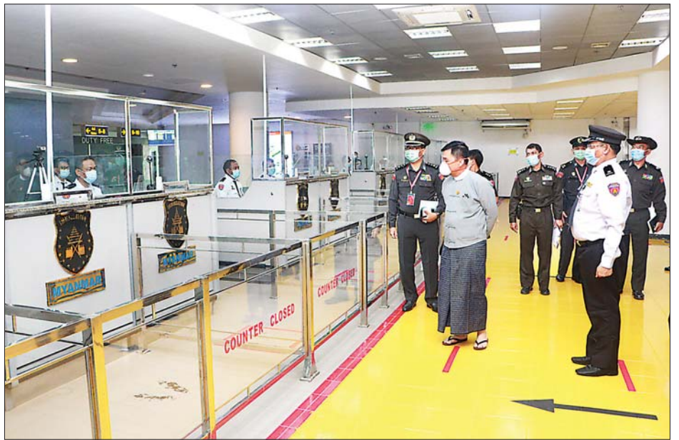
လေသည်။ ယင်းနောက် ပြည်ထောင်စုဝန်ကြီးသည် မန္တလေးအပြည်ပြည်ဆိုင်ရာလေဆိပ် ပြည်ပထွက်ခွာ ကောင်တာ၊ ဆိုက်ရောက်ဗီဇာ (Visa on Arrival - VOA) ကောင်တာ၊ ဆာဘာခန်းနှင့် ပြည်ပဆိုက်ရောက် ကောင်တာတို့ကို ကြည့်ရှုစစ်ဆေးကာ လိုအပ်သည် များ မှာကြားခဲ့ကြောင်း သိရသည်။ (အပေါ်ပုံ) သတင်းစဉ်

ဆောင်ရွက်နေကြရန် လိုအပ်ပါကြောင်း၊ ယခုအခါ ကိုဗစ်-၁၉ ကူးစက်မြန်ရောဂါ ကာကွယ်တားဆီး နိုင်ရေးအတွက် ကျန်းမာရေးဆိုင်ရာ ညွှန်ကြားချက် များကို တိကျစွာ လိုက်နာဆောင်ရွက်နိုင်ရေး တာဝန်ရှိသူအဆင့်ဆင့်က ကြပ်မတ်ဆောင်ရွက် ကြရန်လိုကြောင်း ပြောကြားသည်။ ထို့နောက် တာဝန်ရှိသူများက ပြည်တွင်း/ ပြည်ပ လေကြောင်းလိုင်းများ အခြေအနေနှင့် ပြည်တွင်း/ပြည်ပ ခရီးသွားများ ဝင်ရောက်/ ထွက်ခွာမှု၊ ကိုဗစ်-၁၉ ကာလအတွင်း လုပ်ငန်းများ ဆောင်ရွက်နေမှုနှင့် လုပ်ငန်းဆိုင်ရာ လိုအပ်ချက် များကို ရှင်းလင်းတင်ပြကြရာ ပြည်ထောင်စု ဝန်ကြီးက လိုအပ်သည်များ ညှိနှိုင်းဆောင်ရွက်