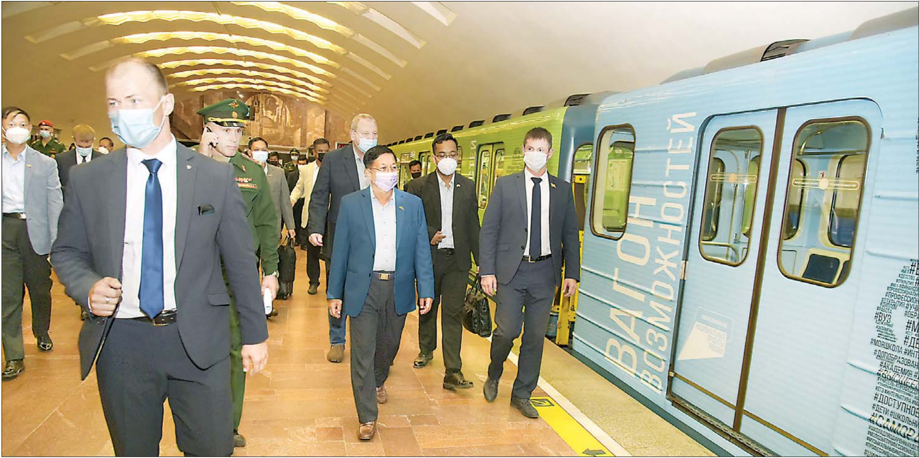
နိုင်ငံတော်စီမံအုပ်ချုပ်ရေးကောင်စီ ဥက္ကဋ္ဌ၊ တပ်မတော်ကာကွယ်ရေးဦးစီးချုပ် ဗိုလ်ချုပ်မှူးကြီး မင်းအောင်လှိုင်နှင့်အဖွဲ့ဝင်များ Novosibirsk မြို့ မြေအောက်ရထားစနစ်များနှင့် ဘူတာရုံများကို ကြည့်ရှု လေ့လာကြစဉ်။

၁၃၈၃ ခုနှစ်၊ နယုန်လပြည့်ကျော် ၄ ရက် ၂၀၂၁ ခုနှစ်၊ ဇွန် ၂၈ ရက်၊ တနင်္လာနေ့ အတွဲ (၆၀)၊ အမှတ် (၂၆၈)