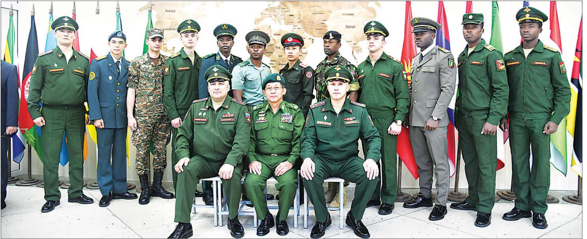
နိုင်ငံတော်စီမံအုပ်ချုပ်ရေးကောင်စီဥက္ကဋ္ဌ၊ တပ်မတော်ကာကွယ်ရေးဦးစီးချုပ် ဗိုလ်ချုပ်မှူးကြီး မင်းအောင်လှိုင် သင်တန်းတက်ရောက်လျက်ရှိကြသည့် နိုင်ငံအသီးသီးမှ ထူးချွန်သင်တန်းသားများနှင့် စုပေါင်း ဓာတ်ပုံရိုက်စဉ်။