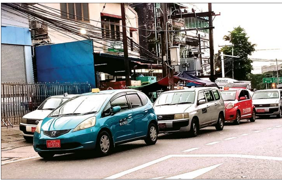
ရန်ကုန်မြို့အတွင်း ပြေးဆွဲပေးလျက်ရှိသော စီးတီးတက္ကစီယာဉ်များကို တွေ့ရစဉ်။

“ရန်ကုန်စီးတီးတက္ကစီတွေကို မှတ်ပုံတင် သက်တမ်းတိုးခြင်းနဲ့ ပတ်သက်ပြီး ကိုဗစ်-၁၉ ကပ်ရောဂါ အခြေအနေတစ်ရပ်ကြောင့် ယာယီရပ်ဆိုင်းထားတာ အခုဆိုရင် တစ်နှစ်ကျော်ရှိပါပြီ။ လုပ်ပေးတဲ့ ရည်ရွယ်ချက်ကလည်း ဒီရန်ကုန်မြို့တွင်းမှာရှိတဲ့ တက္ကစီအငှားယာဉ်တွေ မြို့တော် အင်္ဂါရပ်