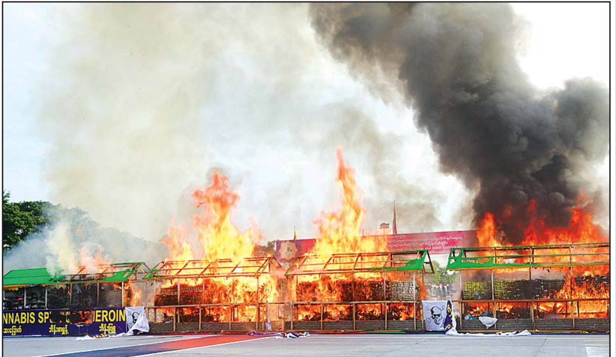
၂၀၂၁ ခုနှစ် အပြည်ပြည်ဆိုင်ရာ မူးယစ်ဆေးဝါးအလှည့်မူနှင့် တရားမဝင်ရောင်းဝယ်မှုတိုက်ဖျက်ရေးနေ့အဖြစ် ရန်ကုန်မြို့၌ ဖမ်းဆီးရမိသော မူးယစ်ဆေးဝါးများကို မီးရှို့ဖျက်ဆီးနေစဉ်။

မူးယစ်ဆေးဝါးသည် ကမ္ဘာပေါ်တွင် ရှေးအကျဆုံးသော ဆေးဝါး တစ်မျိုးဖြစ်သည်။ ယခင်က မူးယစ်ဆေးဝါးကို အပင်များမှရရှိပြီး ဘယဆေးတစ်မျိုးအဖြစ် အသုံးပြုခဲ့ကြသည်။ ဘိန်းပင်၊ ကုက္ကားပင်၊ ဆေးခြောက်ပင်တို့ကို မူးယစ်ဆေးဝါးဟု ခေါ်ပါသည်။ ဘိန်းပင်နှင့် ဆေးခြောက်ပင်တို့သည် ထင်ရှားသည့် မူးယစ်ဆေးဝါးအပင်များ ဖြစ်ကြသည်။ ခေတ်အဆက်ဆက် ပြောင်းလဲလာသော အခြေအနေများ