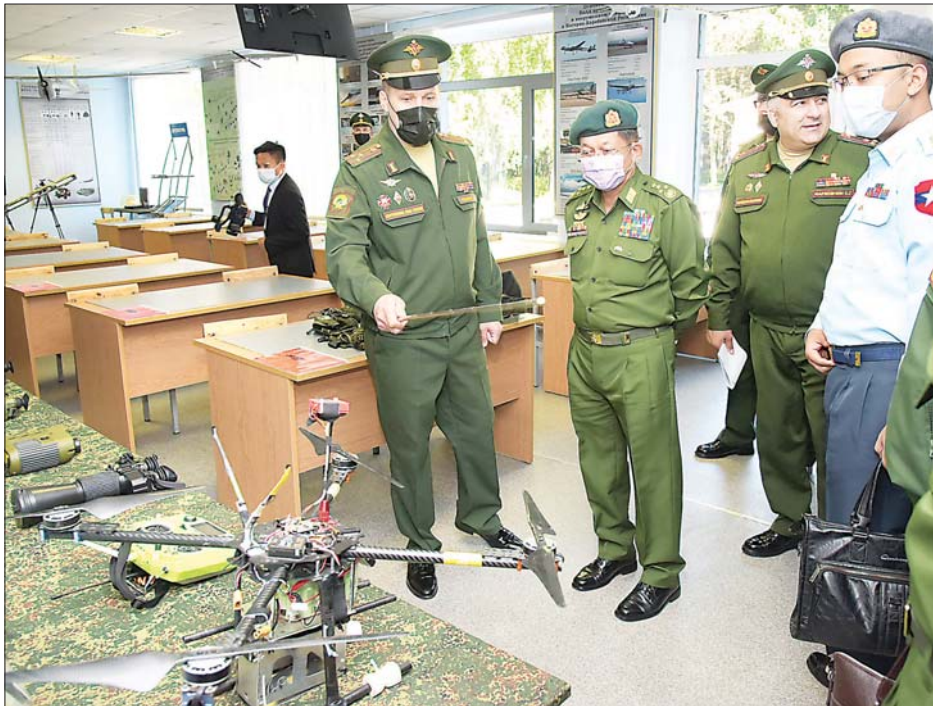
နိုင်ငံတော်စီမံအုပ်ချုပ်ရေးကောင်စီဥက္ကဋ္ဌ၊ တပ်မတော်ကာကွယ်ရေးဦးစီးချုပ် ဗိုလ်ချုပ်မှူးကြီး မင်းအောင်လှိုင် နိုင်ငံတကာမှ စစ်ဘက်ဆိုင်ရာ အသုံးအဆောင်ပစ္စည်းပြခန်းအား ကြည့်ရှုလေ့လာစဉ်။