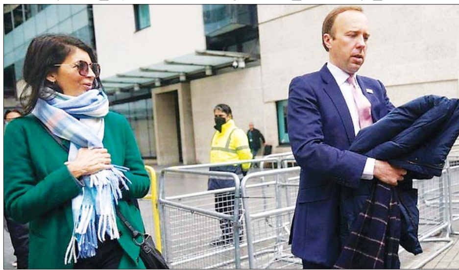
ဗြိတိန်ကျန်းမာရေးဝန်ကြီး မတ်ဟန်ကော့။