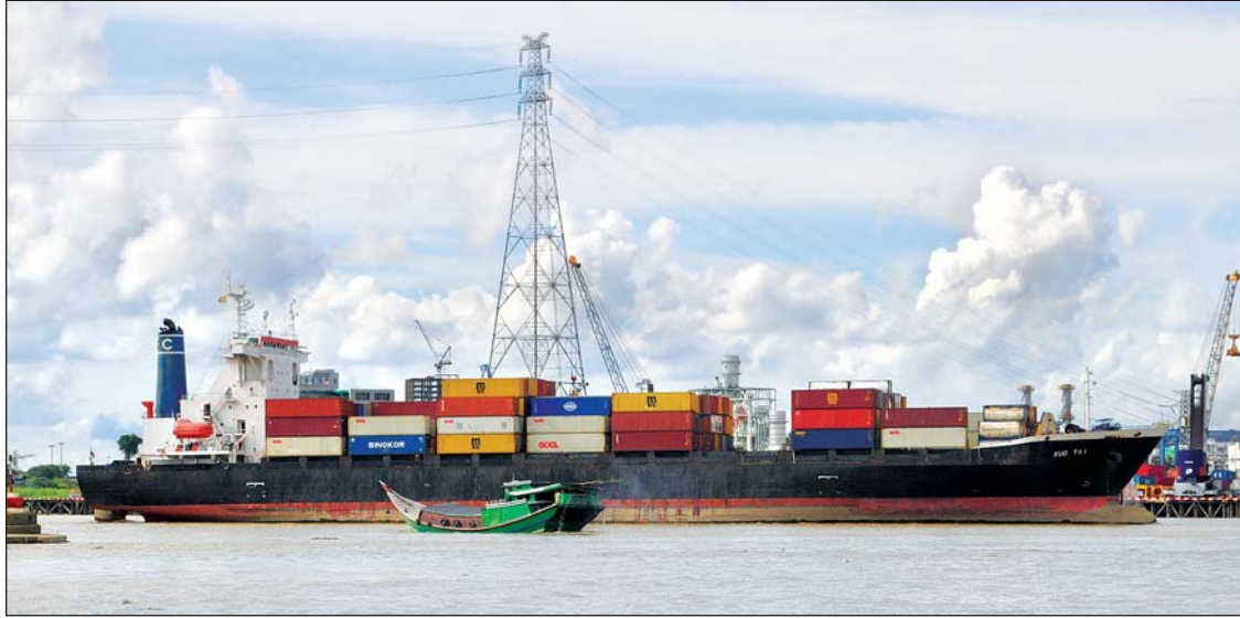
စက်မှုလုပ်ငန်းမှ ကုန်ချောများကို ပြည်ပသို့တင်ပို့သည့် ကုန်တင်သင်္ဘောတစ်စီးကို ရန်ကုန်ဆိပ်ကမ်း၌ တွေ့ရစဉ်

ရန်ကုန် ဇွန် ၂၇ စက်မှုလုပ်ငန်းများ အများဆုံးတည်ရှိရာ ရန်ကုန်မြို့တွင် ကုန်ကြမ်းယူ၍ ကုန်ချော တင်ပို့ရာ၌ ပင်လယ်ရေကြောင်းနှင့် နယ်စပ်လမ်းကြောင်းတို့ကို အသုံးပြုလျက် ရှိရာ လတ်တလောတွင် ပင်လယ်ရေ ကြောင်းမှ သင်္ဘောအဝင်နည်းခြင်းနှင့် နယ်စပ်လမ်းကြောင်းတွင်လည်း သယ်ယူ ပို့ဆောင်ရေး အခက်အခဲများကြောင့် စက်မှုလုပ်ငန်းများ ပိုမိုလည်ပတ်နိုင်ရန် အတွက် သယ်ယူပို့ဆောင်ရေးကဏ္ဍတွင် လည်း ပိုင်းဝန်းဆောင်ရွက်ခြင်းဖြင့် စက်မှု လုပ်ငန်းများ အရှိန်မပျက် လည်ပတ်နေ မည်ဖြစ်ကြောင်း မြန်မာနိုင်ငံ စက်မှုကုန် ထုတ်လုပ်သူများအသင်းမှ သိရသည်။