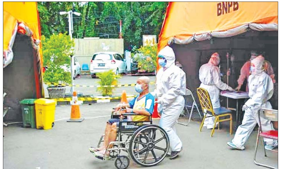
ဆေးရုံအပြင်ဘက်တွင် အရေးပေါ်တံများ ဆောက်လုပ်ကာ လူနာများ ကုသပေးနေရစဉ်။

အနောက်ဂျာဗားပြည်နယ်တွင် လူနာခုတင် အင်န်အိတ်ချ်ကေ