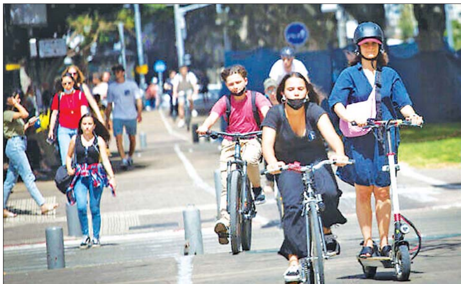
အစွမ်းရှိသည့် တံလီအစစ်မြို့တွင် သွားလာနေကြသူများကို မေ ၅ ရက်က တွေ့ရစဉ်။