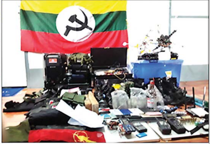
ကရင်ပြည်နယ် မြဝတီမြို့၌ အမျိုးသားလေးဦး၊ အမျိုးသမီးနှစ်ဦးတို့အား LUGER ပစ္စတိုတစ်လက်၊ ကျည် ၁၉ တောင့်၊ လက်လုပ်မိုင်းနှစ်လုံး၊ ဒရုန်းသုံးခု၊ ဆက်စပ်ပစ္စည်းများနှင့်အတူ ဖမ်းဆီးရမိမှု။

ရောက်ရှိနေထိုင်လျက်ရှိကြောင်း သတင်းအရ လုံခြုံရေးတပ်ဖွဲ့ဝင်များပါဝင်သော ပူးပေါင်းအဖွဲ့က သွားရောက်စစ်ဆေးခဲ့ရာ အဆိုပါအခန်းအတွင်းမှ မြဝတီမြို့နယ် ထိပါပလောကျေးရွာနေ ကောင်းမြတ်