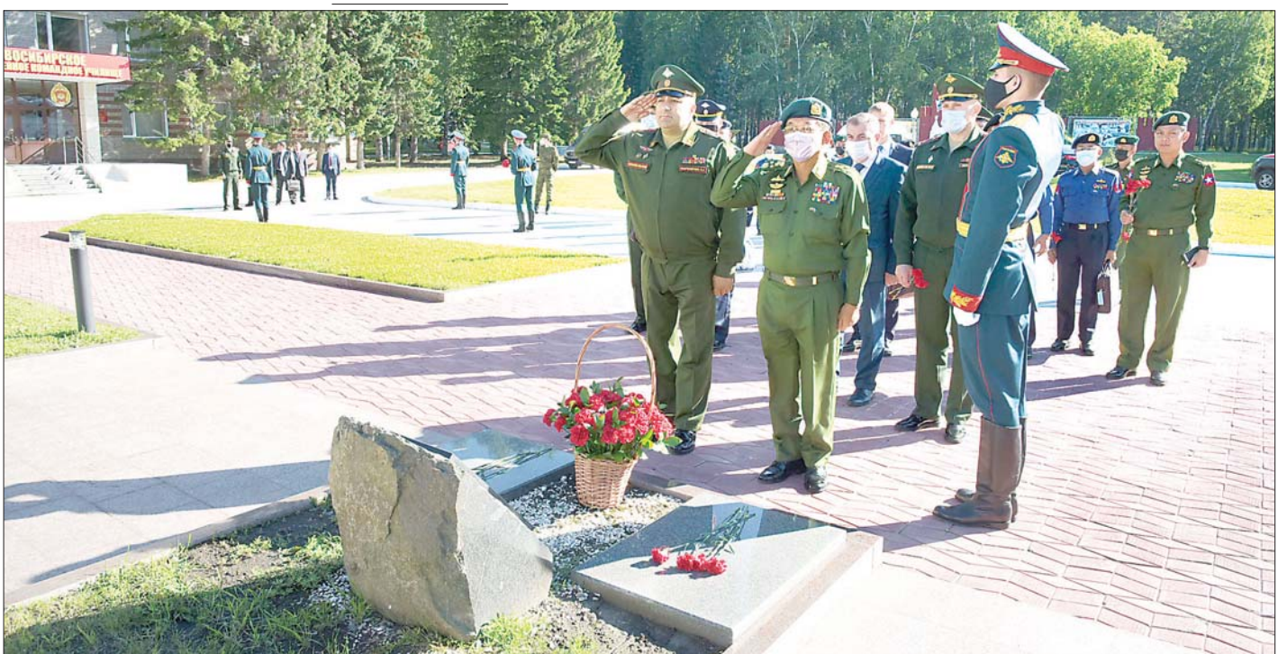
နိုင်ငံတော်စီမံအုပ်ချုပ်ရေးကောင်စီဥက္ကဋ္ဌ၊ တပ်မတော်ကာကွယ်ရေးဦးစီးချုပ် ဗိုလ်ချုပ်မှူးကြီး မင်းအောင်လှိုင် နိုင်ငံတော်အတွက် အသက်စွန့်လွှတ် တာဝန် ထမ်းဆောင်ခဲ့ကြသည့် သူရဲကောင်းဆုတံဆိပ်ရရှိသူများကို ဂုဏ်ပြုထားသည့် သူရဲကောင်းရုပ်တုများအား ဂုဏ်ပြုပန်းခြင်းဖြင့် အလေးပြုစဉ်။

ယင်းနောက် ခေတ္တတည်းခိုမည့် Marriott Hotel အနီးရှိ ရှေးဟောင်းသမိုင်းဝင် Novosibirsk State Academic Opera and Ballet Theatre သို့ ရောက်ရှိ လေ့လာကြရာ ပြဇာတ်ရုံ အုပ်ချုပ်ရေးအဖွဲ့အကြံပေး Mr. Vroskly Valen Arkagievich က ပြဇာတ်ရုံကို ၁၉၃၁ ခုနှစ်တွင် စတင်ဆောက်လုပ်ခဲ့ပြီး ၁၉၄၅ ခုနှစ် မေ ၂၅ ရက်တွင် ဖွင့်ပွဲပြုလုပ်ခဲ့သည့် အခြေအနေများ၊ ၁၉၄၁ ခုနှစ်တွင် ဖွင့်လှစ်ရန် စီစဉ်ထားခဲ့သော်လည်း ဒုတိယကမ္ဘာစစ် ဖြစ်ပွားနေသည့်အတွက် ၁၉၄၅ ခုနှစ် မေ ၉ ရက် စစ်ကြီးပြီးဆုံးသည့် နောက်ပိုင်း တွင် ဖွင့်လှစ်နိုင်ခဲ့ခြင်းဖြစ်ပြီး ကမ္ဘာ့အကြီးဆုံး ပြဇာတ်ရုံများအနက်တစ်ခုဖြစ်ကာ ရုရှားနိုင်ငံတွင်