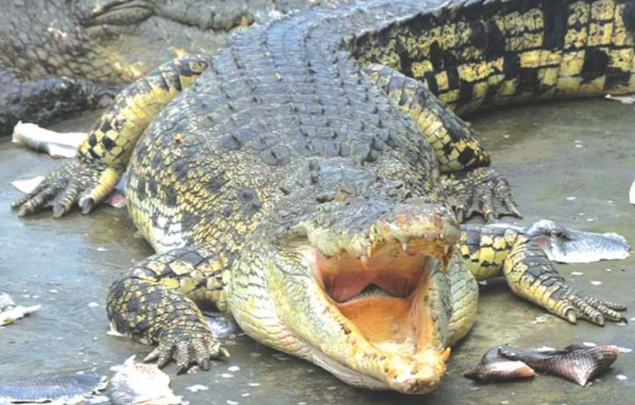
သာကေတမိကျောင်းမွေးမြူရေးစခန်းမှ မိကျောင်းတစ်ကောင်ကို တွေ့ရစဉ်။