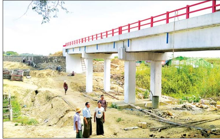
၉၀ ရာခိုင်နှုန်းကျော် တည်ဆောက်ပြီးစီးနေသည့် ကုန်းသောင်ကျေးရွာကုန်ထုတ်တံတား