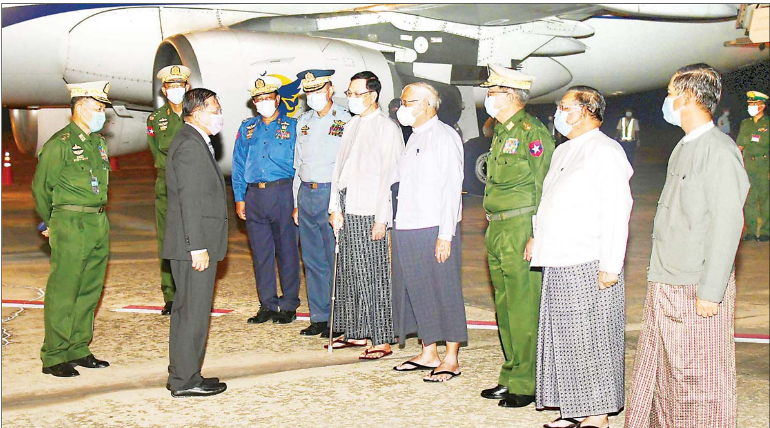
နိုင်ငံတော်စီမံအုပ်ချုပ်ရေးကောင်စီဥက္ကဋ္ဌ၊ တပ်မတော်ကာကွယ်ရေးဦးစီးချုပ် ဗိုလ်ချုပ်မှူးကြီး မင်းအောင်လှိုင်အား ကောင်စီ ဒုတိယဥက္ကဋ္ဌ ဒုတိယ တပ်မတော်ကာကွယ်ရေးဦးစီးချုပ် ကာကွယ်ရေးဦးစီးချုပ် (ကြည်း) ဒုတိယဗိုလ်ချုပ်မှူးကြီး စိုးဝင်း၊ ကောင်စီဝင်များ၊ ပြည်ထောင်စုဝန်ကြီးများနှင့် တာဝန်ရှိသူများက လေဆိပ်၌ ကြိုဆိုနှုတ်ဆက်ကြစဉ်။

နေပြည်တော် ဇွန် ၂၇ နိုင်ငံတော် စီမံအုပ်ချုပ်ရေးကောင်စီဥက္ကဋ္ဌ၊ တပ်မတော်ကာကွယ်ရေးဦးစီးချုပ် ဗိုလ်ချုပ်မှူးကြီး မင်းအောင်လှိုင် ဦးဆောင်သည့် ကိုယ်စားလှယ်အဖွဲ့ဝင်များသည် ယနေ့ ညနေပိုင်းတွင် ရုရှားဖက်ဒရေးရှင်းနိုင်ငံ၊ Novosibirsk မြို့၊ Tolmachevo လေဆိပ်မှ ပြည်ထောင်စုသမ္မတမြန်မာနိုင်ငံတော်သို့ အပြည်ပြည်ဆိုင်ရာ မြန်မာလေကြောင်း (MAI) မှ အထူးလေယာဉ်ဖြင့် ပြန်လည်ထွက်ခွာရာ Siberian ဒေသ ဒုတိယအုပ်ချုပ်ရေးမှူး Mr. Petuhov Yuri Frogravichi Higher Military Command School ကျောင်းအုပ်ကြီး၊ တပ်မတော် ယာယီတပ်မမှူးနှင့် တာဝန်ရှိသူများ၊ ရုရှားနိုင်ငံဆိုင်ရာ မြန်မာနိုင်ငံသံရုံးမှ သံရုံးယာယီတာဝန်ခံ ဦးစော်လင်းဦး၊ စစ်သံမှူးဗိုလ်မှူးချုပ် ကျော်စိုးနှင့် တာဝန်ရှိသူများက လေဆိပ်တွင် လိုက်လံပို့ဆောင် နှုတ်ဆက်ကြသည်။