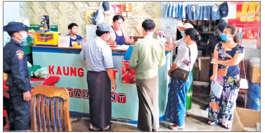
စားသောက်ဆိုင်တစ်ဆိုင်၌ တာဝန်ရှိသူများ ဝင်ရောက်စစ်ဆေးနေစဉ်

စစ်ဆေးရာတွင် ရောင်းချသူများအနေဖြင့် နှာခေါင်းစည်းနှင့် မျက်နှာအကာ (Face shield) တပ်ဆင်၍ စနစ်တကျရောင်းချမှု ရှိမရှိနှင့် အခြား ကျန်းမာရေးဆိုင်ရာ ညွှန်ကြားချက်များကို လိုက်နာဆောင်ရွက်ထားခြင်း ရှိမရှိကို မြို့နယ် ကိုဗစ်-၁၉ ကာကွယ်ထိန်းချုပ် ကုသရေးကော်မတီမှ ဦးဇော်မင်းယု၊ မြို့နယ်အထွေထွေအုပ်ချုပ်ရေး ဦးစီးဌာနမှ ဒုတိယဦးစီးမှူး ဦးလင်းခိုင်ဖြိုးနှင့် မြို့နယ် ပြည်သူ့ကျန်းမာရေး