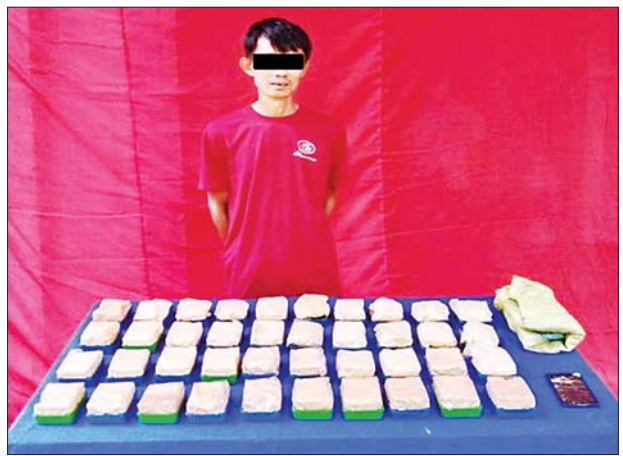
ရဲပြန်ကြား

ထို့အတူ ဇွန် ၂၅ ရက် မွန်းလွဲ ၃ နာရီခွဲတွင် လုံခြုံရေးတပ်ဖွဲ့ဝင်များပါဝင်သော ပူးပေါင်းအဖွဲ့သည် ကလေးမြို့နယ် ဝက်ဖြူကျေးရွာအုပ်စု နန်းပန်တက် ကျေးရွာ စစ်ဆေးရေးဂိတ်အနီးတွင် Super Custom အမျိုးအစား AMBULANCE မော်တော်ယာဉ်သည် စစ်ဆေးရေးဂိတ်သို့မရောက်မီ ရပ်တန့်ပြီး ယာဉ်မောင်းမှာ လမ်းဘေးတောအတွင်းသို့ ထွက်ပြေးသွားသဖြင့် ယာဉ်ကို စစ်ဆေးရာဖွဲ့ရာ ဘိန်းဖြူ ၅ ဒသမ ၂၄၈ ကီလို သိမ်းဆည်းရမိခဲ့သဖြင့် ၎င်းတို့အား မူးယစ်ဆေးဝါးနှင့်စိတ်ကို ပြောင်းလဲစေသော ဆေးဝါးများဆိုင်ရာ ဥပဒေအရ အရေးယူထားကြောင်း သိရသည်။