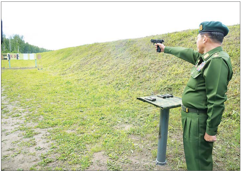
နိုင်ငံတော်စီမံအုပ်ချုပ်ရေးကောင်စီဥက္ကဋ္ဌ၊ တပ်မတော်ကာကွယ်ရေးဦးစီးချုပ် ဗိုလ်ချုပ်မှူးကြီး မင်းအောင်လှိုင် Higher Military Command School အတွင်း လက်တွေ့ပစ်ခတ်မှု စက်ပစ်ကွင်း၌ ကိုယ်တိုင်ပါဝင်လက်တွေ့စမ်းသပ်ပစ်ခတ်စဉ်။

ယင်းနောက် သိပ္ပံနှင့် နည်းပညာဘာသာရပ် အလိုက် သုတေသနတွေ့ရှိချက် ဆိုင်ရာပြခန်းများ၊ ဓာတုဗေဒ၊ ရူပဗေဒ၊ အသုံးချသင်္ချာနှင့် သတင်း အချက်အလက် နည်းပညာဘာသာရပ်၊ ဇီဝဗေဒ၊ Nano နည်းပညာဆိုင်ရာ တီထွင်ဖန်တီးမှုများ၊ ဘူမိ