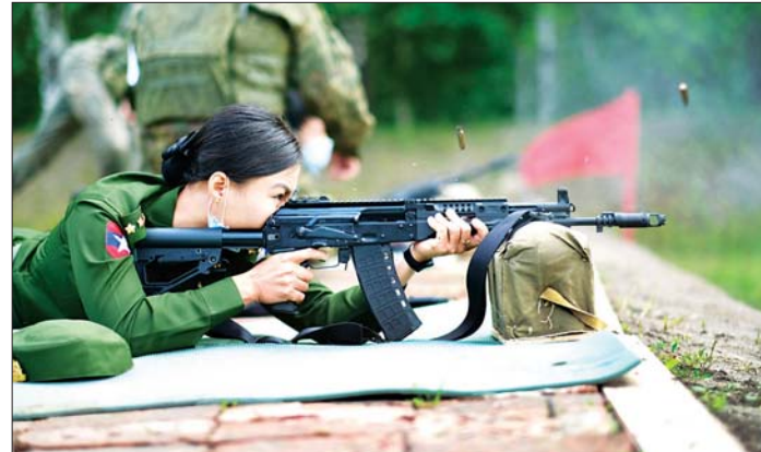
Higher Military Command School အတွင်း အမျိုးသမီးအရာရှိများက စနိုက်ပါ အမျိုးအစား မျိုးစုံတို့ကို လက်တွေ့ရှင်းလင်းပစ်ခတ် ပြသခြင်းများ ပြုလုပ်စဉ်။