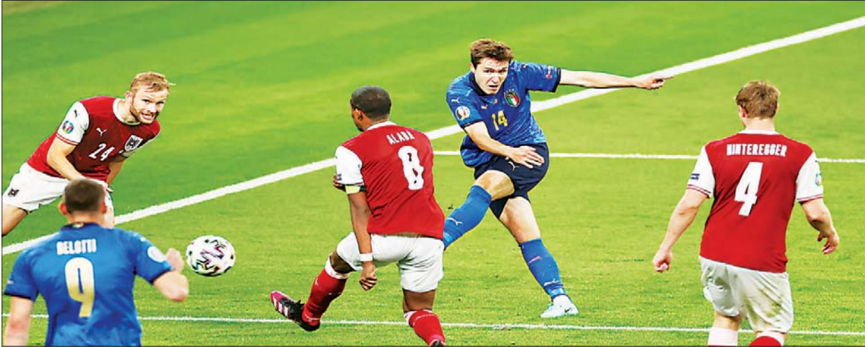
အီတလီအသင်းမှ လူစားဝင်ကစားသမား ချီယေဆာ ဩစတြီးယားအသင်းဘက်သို့ ဂိုးသွင်းယူရန် ကြိုးပမ်းနေမှုကို တွေ့ရစဉ်။