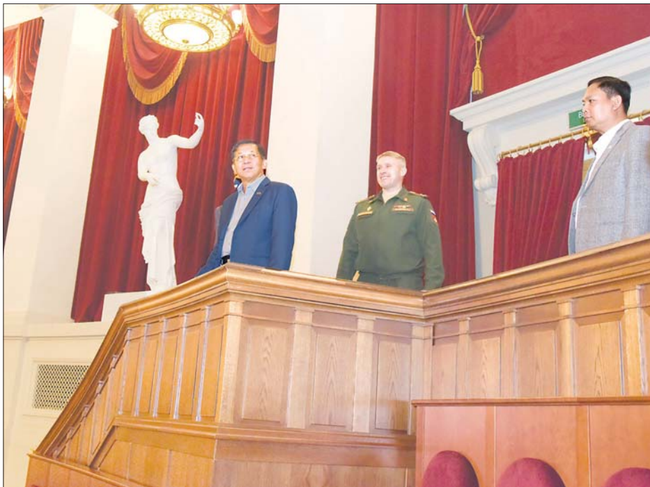
နိုင်ငံတော်စီမံအုပ်ချုပ်ရေးကောင်စီဥက္ကဋ္ဌ၊ တပ်မတော်ကာကွယ်ရေးဦးစီးချုပ် ဗိုလ်ချုပ်မှူးကြီး မင်းအောင်လှိုင် ရှေးဟောင်းသမိုင်းဝင် Novosibirsk State Academic Opera and Ballet Theatre ဌာနကြည့်ရှုလေ့လာစဉ်။