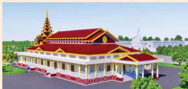
ဓမ္မာရုံ(၂၃၃x၉၀)ပေ ၁ လုံး-၈၇၀၀ သိန်း