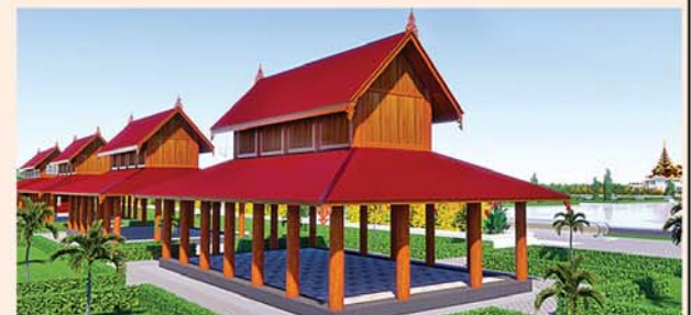
သုဓမ္မာဇရင်(၅၄x၃၀)ပေ ၆ လုံး ၁ လုံးလျှင်-၅၅၇ သိန်း

၁။ နိုင်ငံတော်စီမံအုပ်ချုပ်ရေးကောင်စီဥက္ကဋ္ဌ၊ တပ်မတော်ကာကွယ်ရေးဦးစီးချုပ် ဗိုလ်ချုပ်မှူးကြီးမင်းအောင်လှိုင် ဦးဆောင်သည့် (၇)ရက်သား၊ သမီး၊ ဘုရားဒါယကာ၊ ဒါယိကာမတို့က မာရဝိဇယပုဒ္ဓရုပ်ပွားတော်မြတ်ကြီးအား မြန်မာနိုင်ငံတွင် ထေရဝါဒ ဗုဒ္ဓသာသနာတော်ထွန်းလင်းတောက်ပလှူကံရှိသည်ကို ကမ္ဘာကိုပြသရန်၊ တိုင်းပြည်အေးချမ်းသာယာမှုရှိစေရန်၊ ရုပ်ပွားတော်မြတ်ကြီးအား ပြည်တွင်း၊ ပြည်ပဘုရားများလာရောက်ခြင်းဖြင့် ဒေသတိုးတက်စည်ကားမှုကို အထောက်အကူဖြစ်စေရန်၊ နိုင်ငံတော် ဖွံ့ဖြိုးတိုးတက်မှု အထောက်အကူဖြစ်စေရန်ရည်သန်လျက် ပြည်ထောင်စုနယ်မြေ နေပြည်တော်၊ ဒဂုံ၊ ကာသိရိမြို့နယ်အတွင်း၌ သာသနာတော်ထုံး၊ ရုပ်ပွားဆင်းတုတော်ထုံး၊ မြန်မာ့ရိုးရာတည်ထုံးများနှင့်အညီ တည်ဆောက်ပူဇော်လျက်ရှိပါသည်။