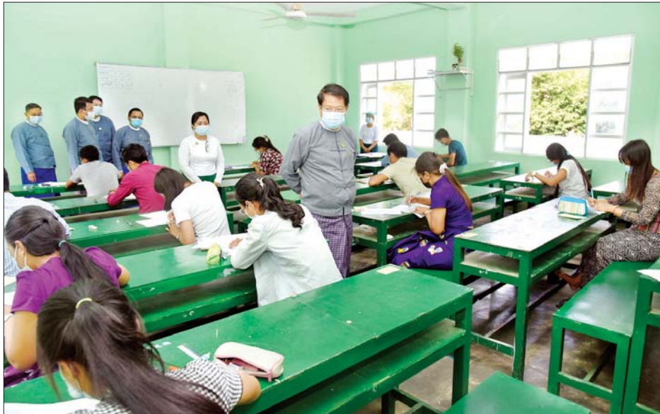
ပြည်ထောင်စုရာထူးဝန်အဖွဲ့ဥက္ကဋ္ဌ ဦးသန်းဆွေ ပြန်တမ်းဝင်အရာရှိအဆင့် စတင်ခန့် လစ်လပ်ရာထူး ရွေးချယ်ပေးရေးအတွက် ရေးဖြေစာမေးပွဲဖြေဆိုမှုကို ကြည့်ရှုစစ်ဆေးစဉ်။