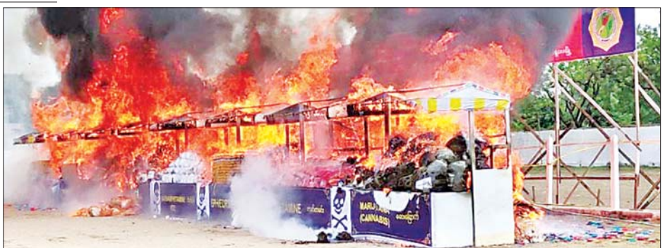
မန္တလေးမြို့၌ ဖမ်းဆီးရမိသည့် မူးယစ်ဆေးဝါးနှင့် ဓာတုပစ္စည်းများအား မီးရှို့ဖျက်ဆီးစဉ်။