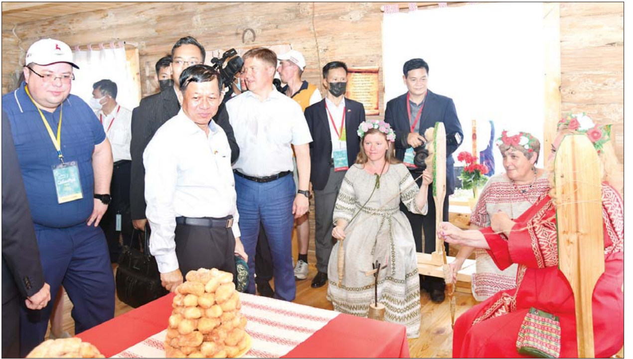
နိုင်ငံတော်စီမံအုပ်ချုပ်ရေးကောင်စီဥက္ကဋ္ဌ၊ တပ်မတော်ကာကွယ်ရေးဦးစီးချုပ် ဗိုလ်ချုပ်မှူးကြီး မင်းအောင်လှိုင် ရိုးရာဒေသအလိုက် ဒေသထုတ်ကုန်ပစ္စည်းများ ခင်းကျင်းပြသထားမှုကို ကြည့်ရှုလေ့လာစဉ်။

ထို့နောက် ရိုးရာနေရာသီပွဲတော်ကို Maidan ရင်ပြင်၌ ကျင်းပပြုလုပ်ရာ Republic of Tatarstan သမ္မတက တက်ရောက်လာကြသူများအား ရင်းရင်းနှီးနှီး လိုက်လံနှုတ်ဆက်ပြီး နှုတ်ခွန်းဆက်စကား ပြောကြားသည်။ ထို့နောက် ရိုးရာနေရာသီပွဲတော် စတင်သည့် အထိမ်းအမှတ်အဖြစ် ယဉ်ကျေးမှုအကအလှများ၊ တေးသီချင်းများ၊ ရိုးရာဓလေ့များကို သရုပ်ဖော်သည့် အကအလှများဖြင့် ဖျော်ဖြေတင်ဆက်ကြရာ တက်ရောက်လာကြသူများက အားပေးခဲ့ကြပြီး ပျော်ရွှင်စွာဖြင့် ပါဝင်ဆင်နွှဲခဲ့ကြ