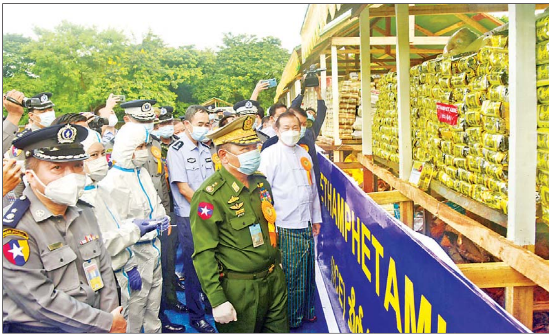
ပြည်ထောင်စုဝန်ကြီး ဒုတိယဗိုလ်ချုပ်ကြီး စိုးထွဋ်၊ မီးရှို့ဖျက်ဆီးမည့် မူးယစ်ဆေးဝါးနှင့် ဓာတုပစ္စည်းများအား ကြည့်ရှုစဉ်။

ဦးစွာ ရန်ကုန်တိုင်းဒေသကြီး လှိုင်သာယာမြို့နယ်ရှိ ရန်ကုန်အနောက်ပိုင်း ကုန်တင်ယာဉ်ရပ်နားကင်း၌ နံနက် ၆ နာရီက ကျင်းပသည့် မီးရှို့ဖျက်ဆီးခြင်း အခမ်းအနားတွင် မူးယစ်ဆေးဝါးနှင့် စိတ်ကိုပြောင်းလဲစေသော ဆေးဝါးများ အန္တရာယ်တားဆီးကာကွယ်ရေး ဗဟိုအဖွဲ့ဥက္ကဋ္ဌ၊ ပြည်ထောင်စုဝန်ကြီးဌာန ပြည်ထောင်စုဝန်ကြီး ဒုတိယဗိုလ်ချုပ်ကြီး စိုးထွဋ်၊ ရန်ကုန်တိုင်းဒေသကြီး စီမံအုပ်ချုပ်ရေးကောင်စီဥက္ကဋ္ဌ ဦးလှစိုးနှင့် အဖွဲ့ဝင်များ၊ မြန်မာနိုင်ငံ ရဲတပ်ဖွဲ့မှ ရဲအရာရှိကြီးများ၊ နိုင်ငံတကာအဖွဲ့အစည်းများမှ ကိုယ်စားလှယ်များ တက်ရောက်၍ ရန်ကုန်တိုင်းဒေသကြီး၊ ဧရာဝတီတိုင်းဒေသကြီး၊ ရခိုင်ပြည်နယ်နှင့် မြန်မာနိုင်ငံ အောက်ပိုင်းဒေသတို့မှ ဖမ်းဆီးရမိသော ဘိန်း ၀ ဒသမ ၀၀၂ ကီလို၊ ဘိန်းဖြူ ၂၄၆ ကီလိုကျော်၊ စိတ်ကြွရူးသွပ်ဆေးပြား ၆၈ သန်းကျော်၊ အိုက်စ ၅၃၃၁ ကီလိုကျော်၊ ဘိန်းစာမှုန့် ၂၁၈၅ ကီလိုကျော်၊ ကတ်တမင်း ၈ ကီလိုကျော်၊ ဆေးခြောက် ၉၂ ကီလိုကျော် အပါအဝင် မူးယစ်ဆေးဝါး ၂၂ မျိုးနှင့် ဓာတုပစ္စည်း သုံးမျိုး စုစုပေါင်း