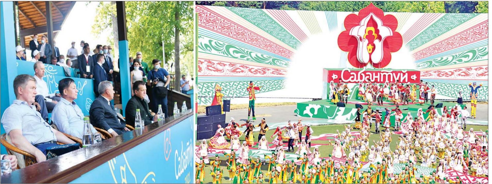
နိုင်ငံတော်စီမံအုပ်ချုပ်ရေးကောင်စီဥက္ကဋ္ဌ၊ တပ်မတော်ကာကွယ်ရေးဦးစီးချုပ် ဗိုလ်ချုပ်မှူးကြီး မင်းအောင်လှိုင် Republic of Tatarstan ၏ ရိုးရာနေရာသီပွဲတော် (Sabantuy) အခမ်းအနားသို့ အထူးဧည့်သည်တော် အဖြစ် တက်ရောက်စဉ်။