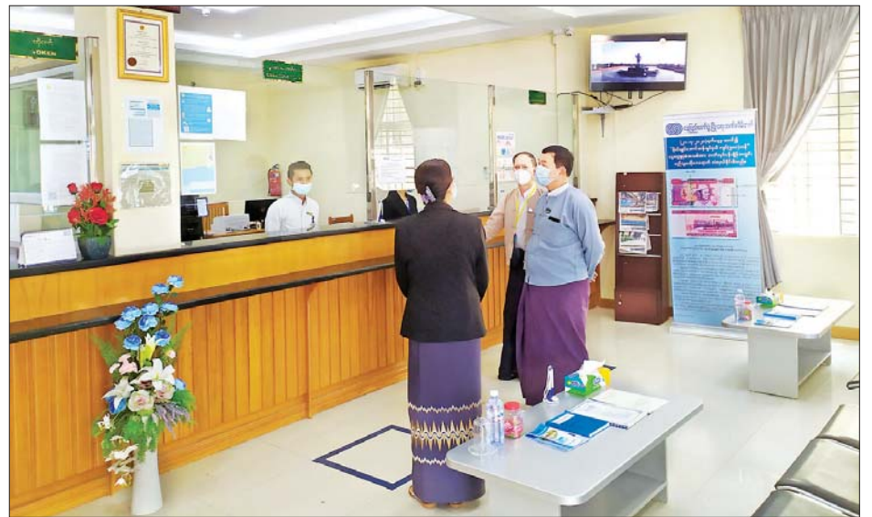
SME & Apartment Loan Services Centre တို့ကို သွားရောက်

၁၉ စည်းကမ်းချက်နှင့်အညီ Customer များကို ကိုဗစ်-၁၉ ကပ်ရောဂါ ကာကွယ်တားဆီးရေး၊ စည်းကမ်းလိုက်နာဆောင်ရွက်စေ ရေး၊ ဘဏ်များ လုံခြုံရေးကိစ္စများ ကို မှာကြားသည်။ ယင်းနောက် ဥက္ကဋ္ဌသီရိ ဘဏ်ခွဲ၊ ပျဉ်းမနားဘဏ်ခွဲ၊ သပြေကုန်းဘဏ်ခွဲ၊ လယ်ဝေး ဘဏ်ခွဲ၊ မြို့မဈေးဘဏ်ခွဲငယ်၊ အာဟာရသုခဈေးဘဏ်ခွဲငယ်နှင့်