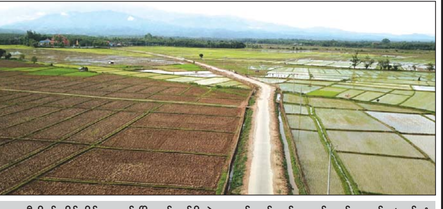
တာချီလိတ်ခရိုင် မိုင်းယောင်းမြို့နယ် ဝမ်ခိုက်-ဟောင်ကျွန်း-ဝမ်ကောင်း-ဝမ်တောင်း (ထပ်လုံ စေတီလမ်း) ကတ္တရာလမ်း။

စာမျက်နှာ ၂၄ မှ အနေမှ ၂၀၂၀ - ၂၀၂၁ ဘဏ္ဍာရေးနှစ် ကုန်ဆုံးချိန် တွင် ရာသီမရွေးသွားလာနိုင်သော ကျေးရွာ ပေါင်း ၃၉၂ ရွာ (၄၂ ရာခိုင်နှုန်း) ရှိလာမည် ဖြစ်သဖြင့် ကျေးလက်လမ်းဖွံ့ဖြိုးရေးဦးစီးဌာန က တာဝန်ယူ ဆောင်ရွက်ခဲ့သည့် လေးနှစ်တာ ကာလအတွင်း ကျေးရွာပေါင်း ၁၄၁ ရွာ (၁၆ ရာခိုင်နှုန်း)သို့ တိုးတက်အောင် ဆောင်ရွက် ပေးနိုင်ခဲ့သည်။ ထိုသို့ ရာသီမရွေး သွားလာနိုင်သည့် ကျေးလက်လမ်းများအဖြစ် ဖော်ဆောင်ခြင်းဖြင့် လူဦးရေ ၇၉ ရာခိုင်နှုန်း နေထိုင်လျက်ရှိသည့် ကျေးလက်ဒေသသည် မြို့ပြနှင့် ကွာဟမှု နည်းပြီး တစ်ပြေးညီ လူမှုစီးပွားဘဝ ဖွံ့ဖြိုး တိုးတက်စေရန် ရှမ်းပြည်နယ်(အရှေ့ပိုင်း) ကျေးလက်လမ်းဖွံ့ဖြိုးရေးဦးစီးဌာနက ကြိုးပမ်း ဆောင်ရွက်နိုင်ခဲ့သည်။ ဆက်လက် အဆင့်မြှင့်တင်မည့် ကျေးလက်လမ်း ဖွံ့ဖြိုးရေးဦးစီးဌာနအနေ