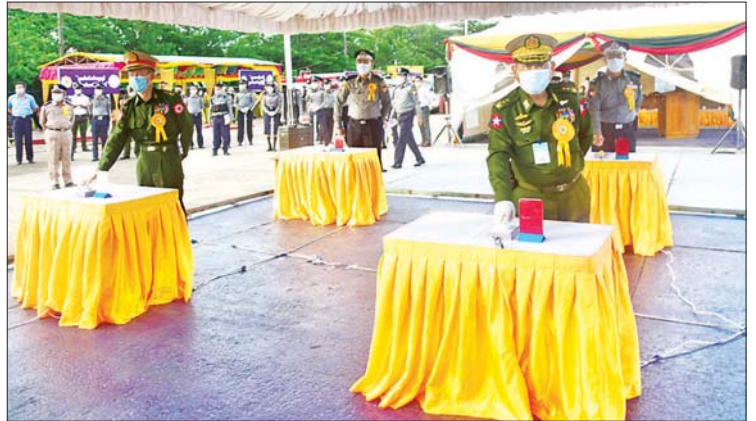
ပြည်ထောင်စုဝန်ကြီး ဒုတိယဗိုလ်ချုပ်ကြီး စိုးထွဋ်နှင့် တာဝန်ရှိသူများ ဖမ်းဆီးရမိသည့် မူးယစ်ဆေးဝါးနှင့် ဓာတုပစ္စည်းများအား စက်ခလုတ်နှိပ်၍ မီးရှို့ဖျက်ဆီးပေးစဉ်။