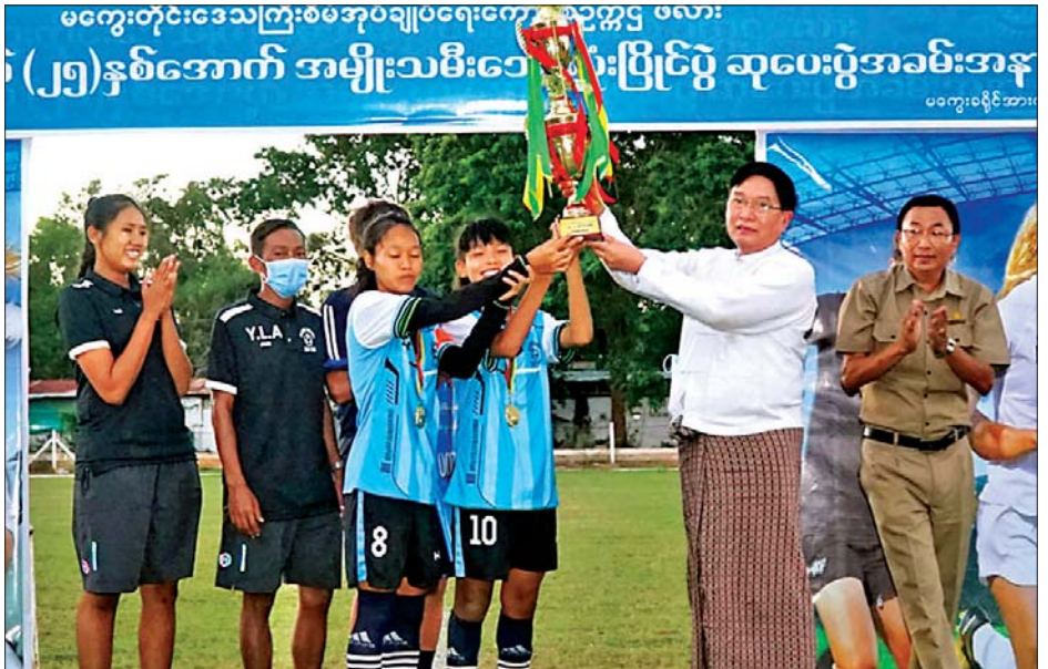
လျှင် ငွေကျပ် ၂၅၀၀၀ တို့အား တိုင်းဒေသကြီး အားကစားနှင့် ရှိသူများက ချီးမြှင့်ပေးအပ် တိုင်းဒေသကြီး စီမံအုပ်ချုပ်ရေး ကာယပညာဦးစီးဌာန ညွှန်ကြား ကြောင်း သိရသည်။ ကောင်စီ ဥက္ကဋ္ဌနှင့် အဖွဲ့ဝင်များ၊ ရေးမှူး ဦးဝင်းအောင်နှင့် တာဝန် မောင်ညီညာ (မကွေး)

မြန်မာ့ဘောလုံးအားကစား ရည်ရွယ်၍ သက်တန်းအလိုက် ကျယ်ပြန့်စွာ တိုးတက်မြှင့်တင်ရေး အားကစားပြိုင်ပွဲများကို ကျင်းပ ကို အထောက်အကူပြုစေရေး၊ ပေးလျက်ရှိရာ တိုင်းဒေသကြီး တိုင်းဒေသကြီးအတွင်းရှိ မြို့နယ် စီမံအုပ်ချုပ်ရေးကောင်စီ ဥက္ကဋ္ဌ များမှ ဘောလုံးအားကစားသမား ဖလား အသက်(၂၅)နှစ်အောက် များအချင်းချင်း သွေးစည်းညီ ညွတ်မှုစိတ်ဓာတ်နှင့် ပြည်ထောင် စုစိတ်ဓာတ်များ ပိုမိုထွန်းကားလာ စေရေးနှင့် ထူးချွန်ထက်မြက် သည့် မျိုးဆက်သစ် လူငယ်သွေး သစ် ဘောလုံးအားကစားသမား များ ပေါ်ထွက်လာစေရေးတို့ကို အသင်းနှင့် မင်းဘူးခရိုင်အသင်းတို့ ယှဉ်ပြိုင်ကစားရာ မကွေးခရိုင် အသင်းက ငါးဂိုး-သုံးဂိုးဖြင့် အနိုင် ရရှိပြီး တံခွန်စိုက်ဆုပေးလားရရှိ သွားသည်။