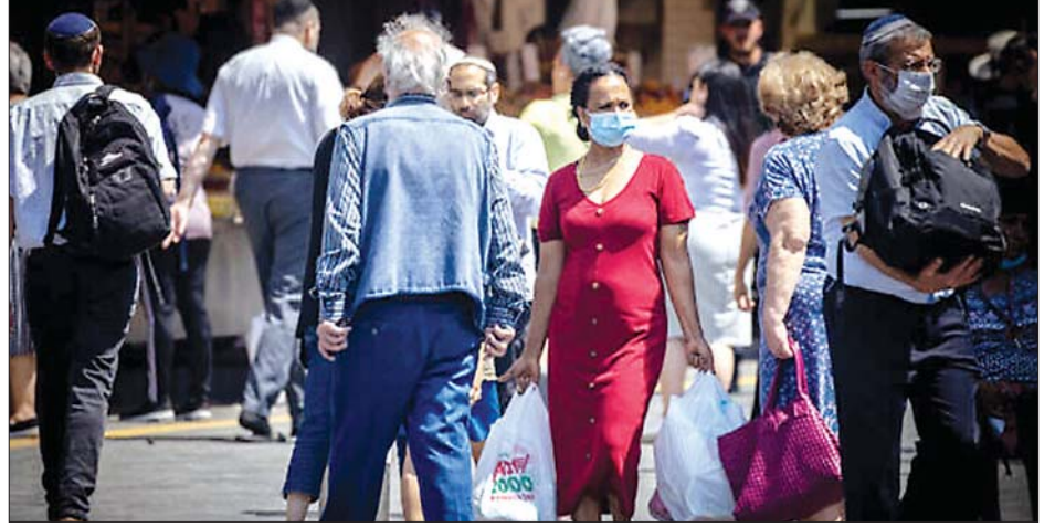
အစ္စရေးနိုင်ငံ ဂျေရုဆလင်တွင် သွားလာလှုပ်ရှားနေကြသူများကို တွေ့ရစဉ်။

ဖယ်ရှားပေးခဲ့သည်။ မကြာသေးမီ သီတင်းပတ်များအတွင်း နေ့စဉ် ကူးစက်မှုနှုန်းမှာ နှစ်ဆနီးပါး ကျဆင်းခဲ့သည်။ သို့သော်လည်း ဇွန် ၂၄ ရက်တွင် ကိုဗစ်-၁၉ ကူးစက် ခံရသူ ၂၀၀ ကျော်ရှိလာခဲ့သည်။ အိန္ဒိယတွင် တွေ့ရှိရ သည့် ဗီဇပြောင်း ကိုဗစ်-၁၉ ကူးစက်မှုများဟု ယူဆ ရသည်။ အစိုးရသည် အသက် ၁၂ နှစ်မှ ၁၅ နှစ်ကြား ကလေးများကို ကိုဗစ်-၁၉ ကာကွယ်ဆေးထိုးပေး နေစဉ် လေဆိပ်တွင်လည်း အသွားအလာ ကန့်သတ် မှုများကို ပြန်လည်ပြုလုပ်နေသည်။ အစ္စရေးနိုင်ငံတွင် ကိုဗစ်-၁၉ ကြောင့် ပြင်းပြင်းထန်ထန် ခံစားရသည့် လူနာအရေအတွက်မှာမူ ဆက်လက်နိမ့်ပါးနေဆဲ ဖြစ်သည်။ အင်န်အိတ်ချ်ကေ