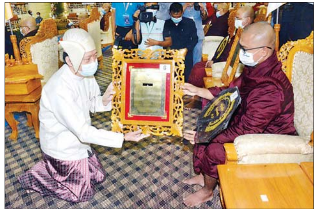
ပိဋကတ်တစ်ပုံ ရေးဖြေအောင် ဝိနယကောဝိဒ ဘွဲ့တံဆိပ်တော်ရ ရန်ကုန်တိုင်းဒေသကြီး ဒဂုံမြို့သစ် (အရှေ့ပိုင်း) မြို့နယ် တိပိဋက မဟာဂန္ထဝင်နိကာယ်ကျောင်းတိုက်မှ အရှင်သုမင်္ဂလအား ကျန်းမာရေးနှင့်အားကစားဝန်ကြီးဌာန ပြည်ထောင်စုဝန်ကြီး ဒေါက်တာ သက်ခိုင်ဝင်း ဘွဲ့တံဆိပ်တော်နှင့် အောင်လက်မှတ် ဆက်ကပ်လှူဒါန်းစဉ်။