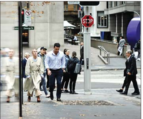
နိုင်ငံတကာရေးရာ စာ - ၁၄

ကိုဗစ် -၁၉ကို အကောင်းဆုံး ထိန်းချုပ်နိုင်ခဲ့သည့် ဩစတြေးလျနှင့် အစ္စရေးနိုင်ငံတို့တွင် ပီဇပြောင်းပိုင်းရပ်စ် ကူးစက်မှုအန္တရာယ်ကြောင့် ကန့်သတ်မှုများ ပြန်လည်ပြုလုပ်