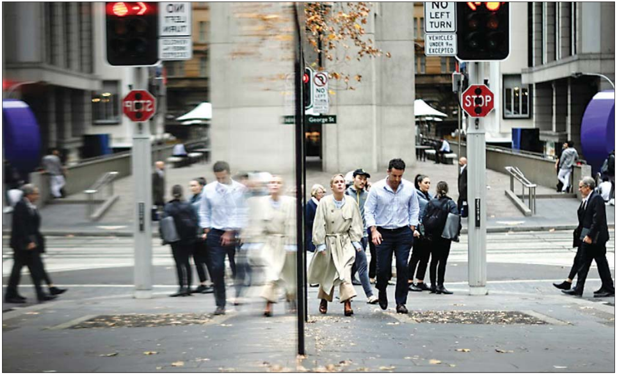
ဆစ်ဒနီမြို့လယ် တစ်နေရာကို တွေ့ရစဉ်။

ဆစ်ဒနီမြို့ အရှေ့ပိုင်းနှင့် အလယ်ပိုင်းဒေသတို့တွင် အနည်းဆုံး သီတင်းတစ်ပတ် နေအိမ်၌သာနေရန် အမိန့်ထုတ်ထားသည်။ နယူးဆောက်ဝေးပြည်နယ်ဝန်ကြီးချုပ် ဂလက်ဒေးဘယ်ရီဂျီကလင်ကလည်း ယခုအချိန်မှာ ကပ်ရောဂါ စတင်ရန်အတွက် ကြောက်စရာ