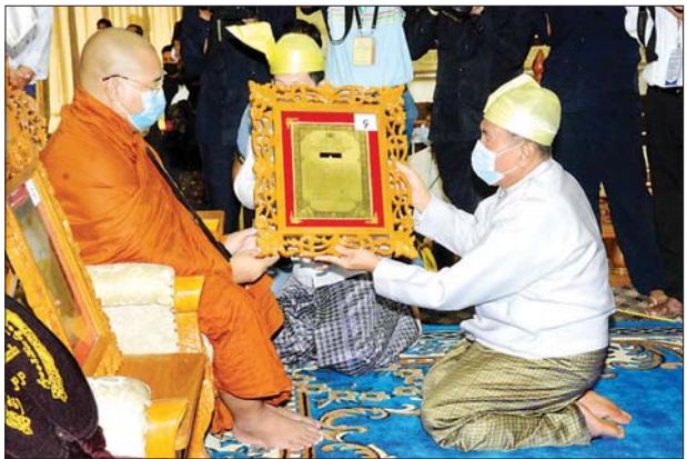
ပိဋကတ်တစ်ပုံ ရေးဖြေအောင် ဝိနယကောဝိဒ ဘွဲ့တံဆိပ်တော်ရ စစ်ကိုင်းတိုင်းဒေသကြီး စစ်ကိုင်းမြို့ မင်းကွန်း မိုးမိတ်ကုန်းမြေ တိပိဋကနိကာယကျောင်းတိုက်မှ အရှင်မင်္ဂလာစာရအား ပြန်ကြားရေးဝန်ကြီးဌာန ပြည်ထောင်စုဝန်ကြီး ဦးချစ်နိုင် ဘွဲ့တံဆိပ်တော်နှင့် အောင်လက်မှတ် ဆက်ကပ်လှူဒါန်းစဉ်။