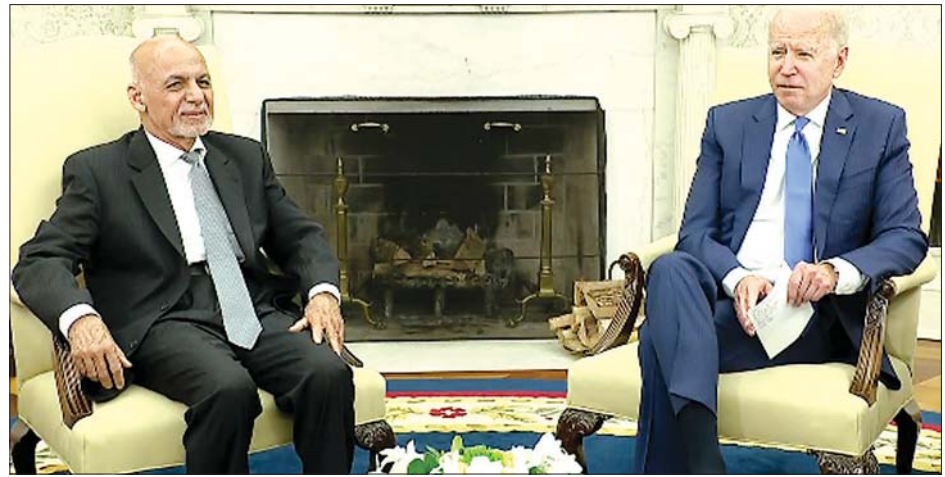
အာဖဂန်နစ္စတန်သမ္မတ အက်ရှရက်ဖ်ဂါနီနှင့် အမေရိကန်သမ္မတ ဂျိုးဘိုင်ဒင်။