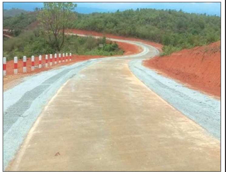
ကျိုင်းတုံခရိုင် ကျိုင်းတုံမြို့နယ် နောင်ငင်း-ဝမ်ဆိုင်း(လွယ်) ကွန်ကရစ်လမ်း။

ထို့အပြင် ဝမ်ဆိုင်းတောင်ပေါ်ကျေးရွာတွင် စိုက်ပျိုးထားသည့် နှစ်ချိုလက်ဖက်ပင်များသည် နှစ်ပေါင်း ၇၀၀ ကျော် သက်တမ်းရှိပြီဖြစ်၍ ကမ္ဘာ့ကုလသမဂ္ဂ ပညာရေး၊ သိပ္ပံနှင့် ယဉ်ကျေးမှုအဖွဲ့ (ယူနက်စကို)၏ အခြေပြု ခြပ်မဲ့ယဉ်ကျေးမှု အမွေအနှစ်အဖြစ် တင်သွင်းရန် ကြိုးပမ်းလျက်ရှိသည့်အတွက် ပြည်တွင်း/