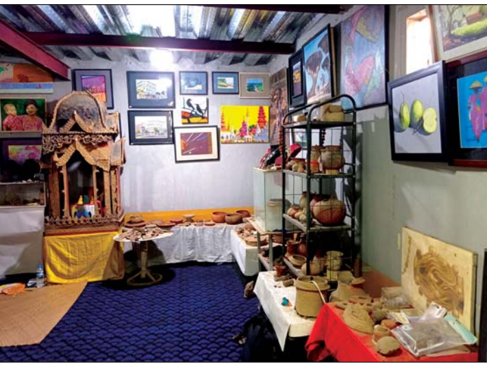
ပြတိုက်ငယ်အတွင်းမှ ရှေးဟောင်းပျူခေတ်ပစ္စည်းများနှင့် ယနေ့ကာလ နိုင်ငံကျော် ပန်းချီဆရာများ၏လက်ရာ ပန်းချီကားများ။

မတိမ်ကော မပျောက်ပျက်သွားအောင် ထိန်းသိမ်းစောင့်ရှောက်ရန် ရည်ရွယ်ချက် တွေနဲ့ ပြတိုက်ကို ယနေ့အထိ ဖွင့်လှစ်ခဲ့ တာဖြစ်ပါတယ်”ဟု ပြောသည်။ ပြတိုက်ထဲတွင် ပျူခေတ်မှ အသုံး အဆောင်ပစ္စည်းများ၊ ပုတီးစေ့ မျိုးစုံ၊ အိုးခွက်ပန်းကန်မျိုးစုံ၊ အုတ်ဒီဇိုင်းမျိုးစုံ၊ အိုးခြမ်းပွဲများ၊ အရိုးအိုးများ၊ ပျူခေတ်က လူသေမြုပ်နှံရာတွင် အသုံးပြုကြသည့် တန်ဆာဆင်ပစ္စည်းများ၊ ပျူခေတ်မှ သံ လက်နက်/ကြေးလက်နက် ပစ္စည်းမျိုးစုံ စသည်တို့အပြင် မင်းဘူးဒေသ သမိုင်းမှ ထင်ရှားသူ လူပုဂ္ဂိုလ်များ၏ အတ္ထုပ္ပတ္တိ များ၊ နိုင်ငံကျော် ပန်းချီပညာရှင်များ၏ အနုပညာလက်ရာမြောက် ပန်းချီကား များ၊ ကျောက်ခေတ်၊ ကြေးခေတ်၊ သံ ခေတ်၊ ပျူခေတ် ပစ္စည်းများနှင့် ခေတ် အဆက်ဆက် အထင်ကရ ရှေးဟောင်း ပစ္စည်းများ စသည်ဖြင့် ပစ္စည်းအမျိုး အစားပေါင်းများစွာကို ခင်းကျင်းပြသ ထားသည်ကို တွေ့ရသည်။ PANHTWAR GALLERY ပြတိုက်