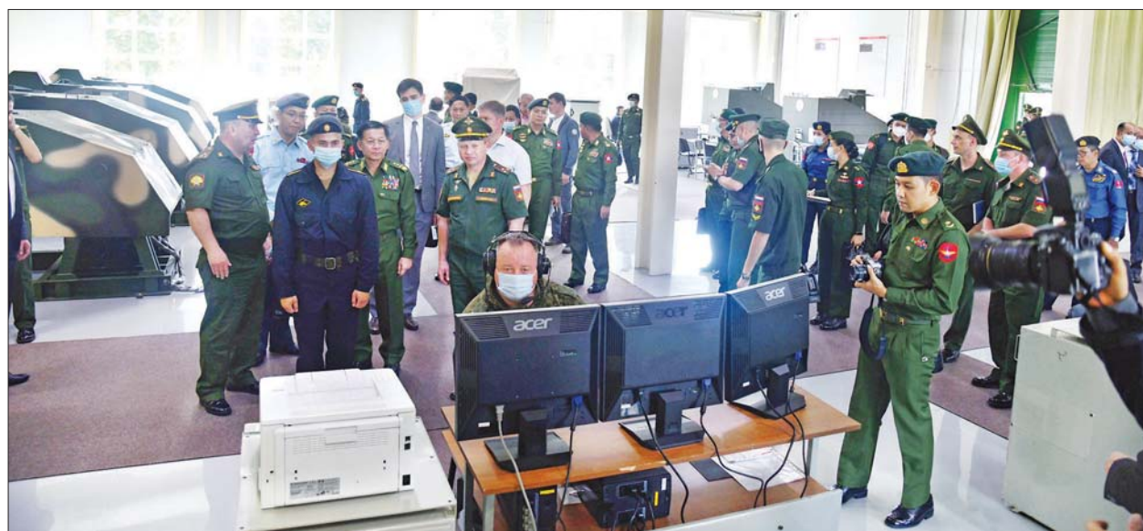
နိုင်ငံတော်စီမံအုပ်ချုပ်ရေးကောင်စီဥက္ကဋ္ဌ၊ တပ်မတော်ကာကွယ်ရေးဦးစီးချုပ် ဗိုလ်ချုပ်မှူးကြီး မင်းအောင်လှိုင် Kazan မြို့တော်ရှိ Kazan Higher Tank Red Banner Command School သို့ ကြည့်ရှုလေ့လာစဉ်။

နိုင်ငံတော် စီမံအုပ်ချုပ်ရေးကောင်စီဥက္ကဋ္ဌ၊ တပ်မတော်ကာကွယ်ရေးဦးစီးချုပ် ဗိုလ်ချုပ်မှူးကြီး မင်းအောင်လှိုင် ဦးဆောင်သည့် ကိုယ်စားလှယ်အဖွဲ့သည် စစ်သံမှူး ဗိုလ်မှူးချုပ် ကျော်စိုးမိုးနှင့် တာဝန်ရှိသူများ လိုက်ပါ၍ ယနေ့နံနက်ပိုင်းတွင် Republic of the Tatarstan ၊ Kazan မြို့တော်ရှိ Kazan Higher Tank Red Banner Command School သို့ သွားရောက်ကြည့်ရှုလေ့လာကြသည်။