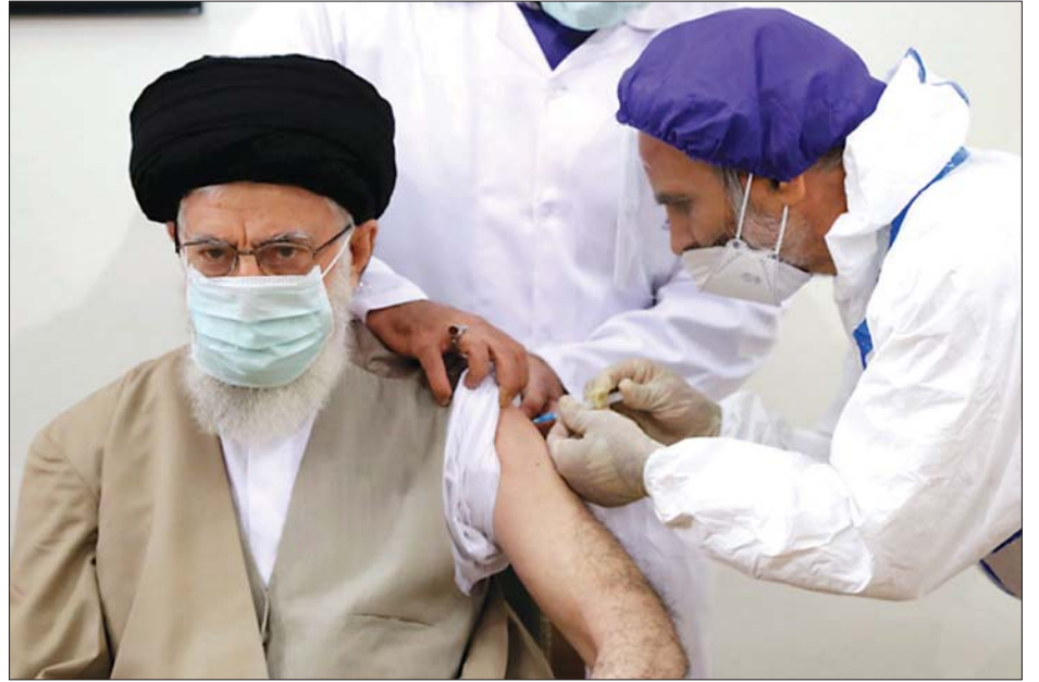
အယာတိုလာအလီခါမေန်ကို ကိုဗစ်-၁၉ ကာကွယ်ဆေးထိုးပေးနေစဉ်။

ခဲ့သည်။ ဇန်နဝါရီလအတွင်းက အမေရိကန်လုပ် ကိုဗစ်- ၁၉ ကာကွယ်ဆေးများ တင်သွင်းခြင်းကို ခါမေန်က ပိတ်ပင်ခဲ့သည်။ အဆိုပါ ကာကွယ်ဆေးများမှာ မယုံကြည်ရဟု ၎င်းက ပြောကြားခဲ့သည်။ ဖေဖော်ဝါရီလမှစတင်ကာ တရုတ်နိုင်ငံနှင့် ရုရှားနိုင်ငံထုတ် ကာကွယ်ဆေးများကို အီရန်တွင် စတင်ထိုးနှံပေးခဲ့သည်။ အီရန်နိုင်ငံတွင် နေ့စဉ် ကိုဗစ်- ၁၉ ကူးစက်မှုမှာ ၁၀၀၀၀ ကျော် ရှိသည်။ ဇွန် ၂၅ ရက်အထိ လူပေါင်း ၄ ဒသမ ၅ သန်း သို့မဟုတ် လူဦးရေစုစုပေါင်း ငါးရာခိုင်နှုန်း ကိုဗစ်-၁၉ ကာကွယ်ဆေး ထိုးပေးပြီးဖြစ်သည်။ အင်န်အိတ်ချ်ကေ