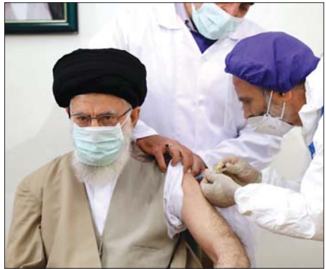
နိုင်ငံတကာသတင်း စာ - ၁၃

အီရန်နိုင်ငံ၏ အရေးပါဆုံး ခေါင်းဆောင် ဒါမေနီကို ကိုဗစ် -၁၉ ကာကွယ်ဆေးထိုးပေး