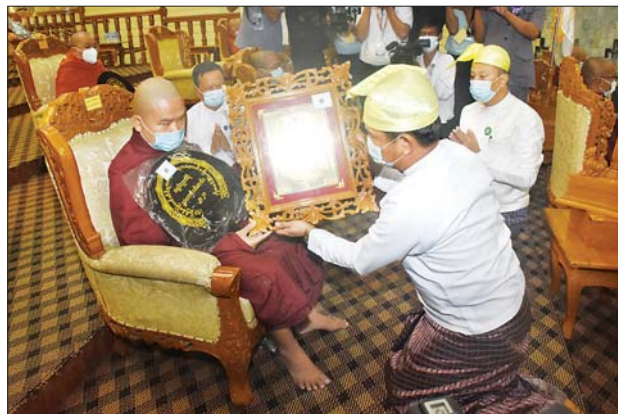
ဝိနည်းပထမပိုင်း ရေးဖြေအောင် ဥဘတောဝိဘင်္ဂ ကောဝိဒ ဘွဲ့တံဆိပ်တော်ရ စစ်ကိုင်းတိုင်းဒေသကြီး စစ်ကိုင်းမြို့ မင်းကွန်း မိုးမိတ်ကုန်းမြေ တိပိဋကနိကာယကျောင်းတိုက်မှ အရှင်ပညာသီရိ (ဆီဆိုင်)အား ကာကွယ်ရေးဦးစီးချုပ်ရုံး (ကြည်း)မှ ဒုတိယဗိုလ်ချုပ်ကြီး သက်ပုံ ဘွဲ့တံဆိပ်တော်နှင့် အောင်လက်မှတ် ဆက်ကပ်လှူဒါန်းစဉ်။