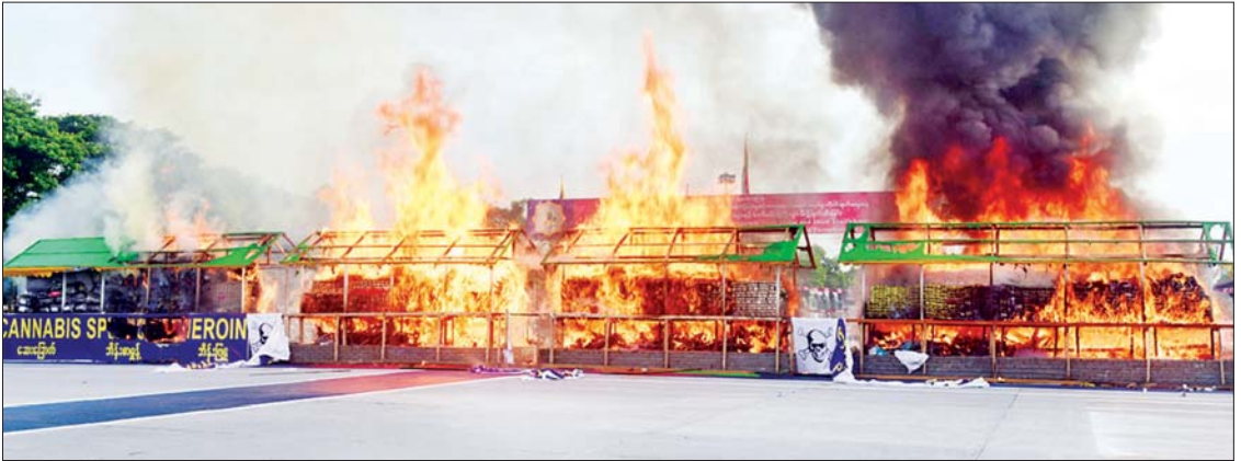
မန္တလေးမြို့၌ ဖမ်းဆီးရမိသည့် မူးယစ်ဆေးဝါးနှင့် ဓာတုပစ္စည်းများအား မီးရှို့ဖျက်ဆီးစဉ်။