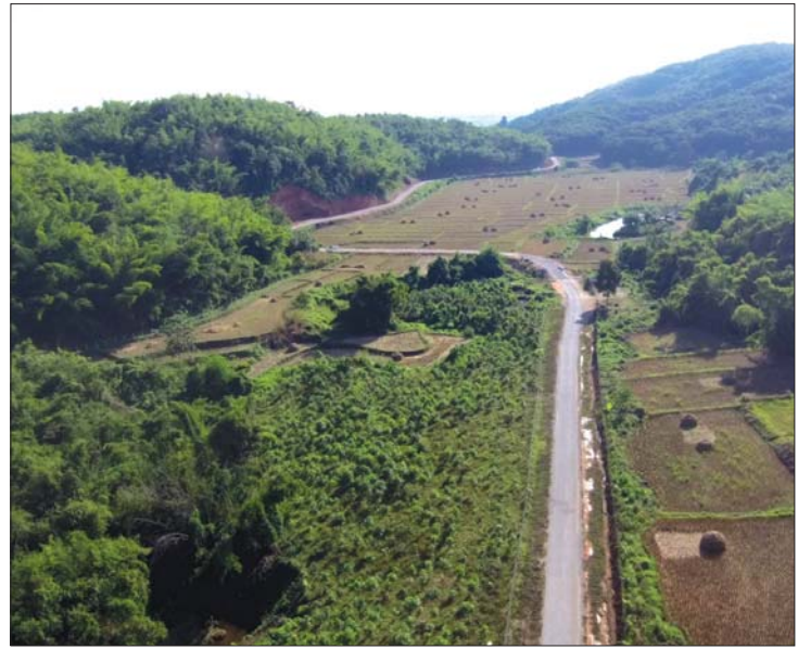
တာချီလိတ်ခရိုင် တာချီလိတ်မြို့နယ် ယန်းကျောက်-ကော်မယ်လိတ်-မလိပါကော် -ပေလေလန် ကတ္တရာလမ်း

မဟာဗျူဟာ ရည်မှန်းချက်အပေါ် အကောင်အထည်ဖော် ဆောင်ရွက်နိုင်မှု အနေဖြင့် ဌာနကွပ်ကဲမှုအောက်ရှိ ကျေးရွာပေါင်း ၉၃၆ ရွာတွင် ၂၀၁၇-၂၀၁၈ ဘဏ္ဍာရေးနှစ်က ရာသီမရွေးသွားလာနိုင်သော ကျေးရွာပေါင်း ၂၅၁ ရွာ (၂၆ ရာခိုင်နှုန်း)သာ ရှိခဲ့သည့်အခြေ