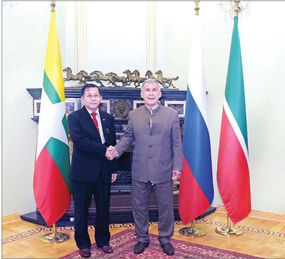
နိုင်ငံတော်စီမံအုပ်ချုပ်ရေးကောင်စီဥက္ကဋ္ဌ၊ တပ်မတော်ကာကွယ်ရေးဦးစီးချုပ် ဗိုလ်ချုပ်မှူးကြီး မင်းအောင်လှိုင်နှင့် Republic of the Tatarstan သမ္မတ Mr. Rustam Nurgaliyevich Minnikhanov တို့ ရင်းနှီးမြုပ်နှံမှုနှင့် တွေ့ဆုံနှုတ်ဆက်စဉ်။

အဆိုပါ တွေ့ဆုံပွဲသို့ နိုင်ငံတော်စီမံအုပ်ချုပ်ရေးကောင်စီဥက္ကဋ္ဌ၊ တပ်မတော်ကာကွယ်ရေးဦးစီးချုပ်နှင့်အတူ နိုင်ငံတော်စီမံအုပ်ချုပ်ရေးကောင်စီဝင် ဒုတိယ ဗိုလ်ချုပ်ကြီး မိုးမြင့်ထွန်း၊ ကောင်စီတွဲဖက်အတွင်းရေးမှူး ဒုတိယဗိုလ်ချုပ်ကြီး ရဲဝင်းဦး၊ ကာကွယ်ရေးဦးစီးချုပ်ရုံးမှ တပ်မတော်အရာရှိကြီးများ၊ နေပြည်တော်ကောင်စီဥက္ကဋ္ဌ၊ မြို့တော်ဝန်ဒေါက်တာမောင်မောင်နိုင်၊ ရင်းနှီးမြုပ်နှံမှုနှင့် နိုင်ငံခြားစီးပွားဆက်သွယ်ရေးဝန်ကြီးဌာန ဒုတိယ