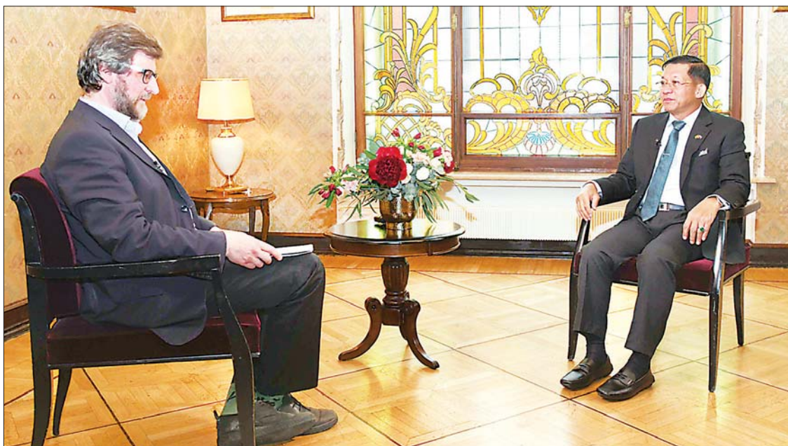
နိုင်ငံတော်စီမံအုပ်ချုပ်ရေးကောင်စီဥက္ကဋ္ဌ တပ်မတော်ကာကွယ်ရေးဦးစီးချုပ် ဗိုလ်ချုပ်မှူးကြီးမင်းအောင်လှိုင် ရုရှားပတ်ဒရေရှင်းနိုင်ငံ၊ Russia 24 ရုပ်သံသတင်းဌာန၊ International Review အစီအစဉ်မှ ပင်တိုင်သတင်းတင်ဆက်သူ Mr. Fedor Lukyanov အား တွေ့ဆုံ၍ သိရှိလိုသည်မေးမြန်းမှုများကို ဖြေကြားစဉ်။

ကျွန်တော်ကတော့ စပြီးတက်ကတည်းက ရှေ့လုပ်ငန်းစဉ် (၅)ချက် ကြေညာထားတာရှိတယ်။ အဲဒီမှာ အရေးပေါ်အခြေအနေကာလတွေ ကျော်လွန်ပြီး ဆောင်ရွက်ပြီးပြီဆိုလို့ရှိရင် လုပ်သင့်လုပ်ဆောင်တာတွေပြီးအောင် ဆောင်ရွက်ပြီးပြီဆိုလို့ရှိရင် ဒီမိုကရေစီနည်းလမ်းတကျ ရွေးကောက်ပွဲတစ်ခုကို ကျွန်တော်ပြန်လုပ်မယ်လို့ ပြောထားတာ ရှိတယ်။ မဖြစ်မနေလုပ်မှာပါ။ သို့သော်လည်းပဲ တည်ငြိမ်အေးချမ်းတဲ့အခြေအနေ ရောက်ဖို့တော့ လိုပါတယ်။ နောက်တစ်ခါ ရွေးကောက်ပွဲအတွက် လိုအပ်တဲ့ပြင်ဆင်မှုတွေ ပြီးမြောက်အောင်လည်း လိုပါတယ်။ ဒီအပေါ်မှာ ပြီးလို့ရှိရင်တော့ ရွေးကောက်ပွဲမလွှဲမသွေလုပ်မယ်ဆိုတာ ကျွန်တော်ပြောလိုတယ်။ မေး။ ကျွန်တော်တို့လက်ရှိ အခြေအနေမှာ ရွေးကောက်ပွဲအတွက် တိကျတဲ့ကာလ တစ်ခုကို လက်ရှိအချိန်မှာဖြေကြားပေးဖို့ ခက်နိုင်ပါသလား။ ဖြေ။ လက်ရှိဖြစ်ပေါ်နေတဲ့ အခြေအနေ တည်ငြိမ်အေးချမ်းမှုအပေါ်မှာ မူတည်တာပေါ့ဗျာ။ ကျွန်တော်မှာ ဒီအခြေခံဥပဒေအရ ကျွန်တော်တို့ အရေးပေါ်ကာလတစ်ခုစီပဲ ကြေညာလို့လုပ်လို့ရပါတယ်။ ဒါကိုမပြီး မြောက်ဘူးဆိုလို့ရှိရင် ကျွန်တော်တာဝန် ရှိတဲ့အဖွဲ့အစည်းကို ကျွန်တော်ပြန်လည် တင်ပြပြီးတော့မှ ၆ လတစ်ကြိမ် ၆ လတစ်ကြိမ် သက်တမ်းနှစ်ကြိမ် တိုးခွင့်ရှိတယ်။ အားလုံးတစ်နှစ် အားလုံးနှစ်နှစ် အဲဒီတော့ အကြမ်းဖျင်းအားဖြင့်တော့ ဒီနှစ်နှစ်အတွင်းမှာတော့ ရွေးကောက်ပွဲ ပြန်ဖြစ်ဖို့အတွက် လမ်းစဉ်တယ်ဆိုတာကို ကျွန်တော်ပြောလိုတယ်။ ဒီလိုတော့ဖြေလို့ ရတာပေါ့ဗျာ။ အခု တိုင်းပြည်ရေးရာ ဟာ အခုလက်ရှိ အခြေအနေမှာတော့ ကျွန်တော်တို့ဟာ ၁၀၀ ရာခိုင်နှုန်းအား