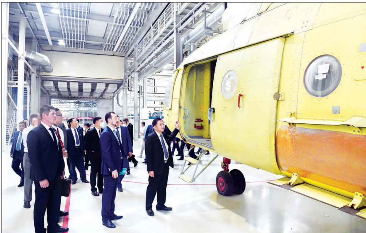
နိုင်ငံတော်စီမံအုပ်ချုပ်ရေးကောင်စီဥက္ကဋ္ဌ၊ တပ်မတော်ကာကွယ်ရေးဦးစီးချုပ် ဗိုလ်ချုပ်မှူးကြီး မင်းအောင်လှိုင် Kazan မြို့တော်ရှိ PJSC “Kazan Helicopters” ထုတ်လုပ်ရေးအလုပ်ရုံသို့ ကြည့်ရှုလေ့လာစဉ်။

အဆိုပါ PJSC “Kazan Helicopters” ထုတ်လုပ်ရေးအလုပ်ရုံသည် ၁၉၄၀ ပြည့်နှစ်တွင် စတင်တည်ထောင်ခဲ့ခြင်းဖြစ်ပြီး Rostec Cooperation မှ ပိုင်ဆိုင်သည့် Russian Helicopters ကုမ္ပဏီ၏ အစိတ်အပိုင်းတစ်ခုဖြစ်ကြောင်း၊ ယနေ့အချိန်ကာလအထိ Mi-4၊ Mi-8၊ Mi-14၊ Mi-17 နှင့် Ansat အမျိုးအစား ရဟတ်ယာဉ်ပေါင်း ၁၂၀၀၀