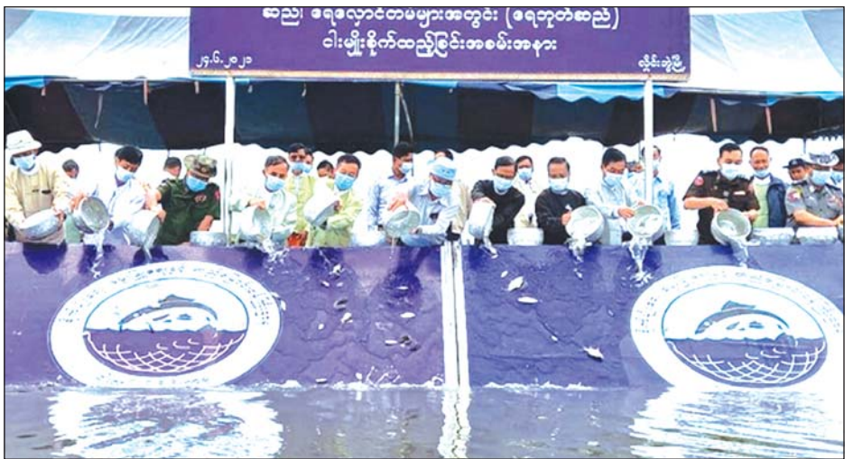
လှိုင်းဘွဲ့မြို့နယ်ရှိ ရေဘုတ်ဆည်အတွင်းသို့ ငါးမျိုးများ စိုက်ထည့်စဉ်။

လှိုင်းဘွဲ့ ဇွန် ၂၆ ကရင်ပြည်နယ် ငါးလုပ်ငန်းဦးစီးဌာနသည် သဘာဝ မြစ်ချောင်းများ၊ ဆည်ရေလှောင်တံခံများအတွင်း ငါးသယ်ဇာတ ပေါကြွယ်ဝရေးနှင့် ပြည်သူများ ငါး ရိုကျာများကို စဉ်ဆက်မပြတ် စားသုံးနိုင်ရေးအတွက် ငါးမျိုးစိုက်ထည့်ခြင်းကို ဆောင်ရွက်လျက်ရှိရာ ဇွန် ၂၄ ရက်က လှိုင်းဘွဲ့မြို့နယ်ရှိ ရေဘုတ်ဆည် အတွင်းသို့ ဘားအံငါးလုပ်ငန်းစခန်းမှ ဖြန့်ဖြူးသည့် နှစ်လက်မအောက်ခံ ငါးမြစ်ချင်းသားပေါက် ကောင် ရေ ၅၀၀၀၀ နှင့် ထိုင်းငါးခုံးမကြီးသားပေါက် ကောင် ရေ ၅၀၀၀၀ တို့ကို မျိုးစိုက်ထည့်ကြောင်း သိရ သည်။