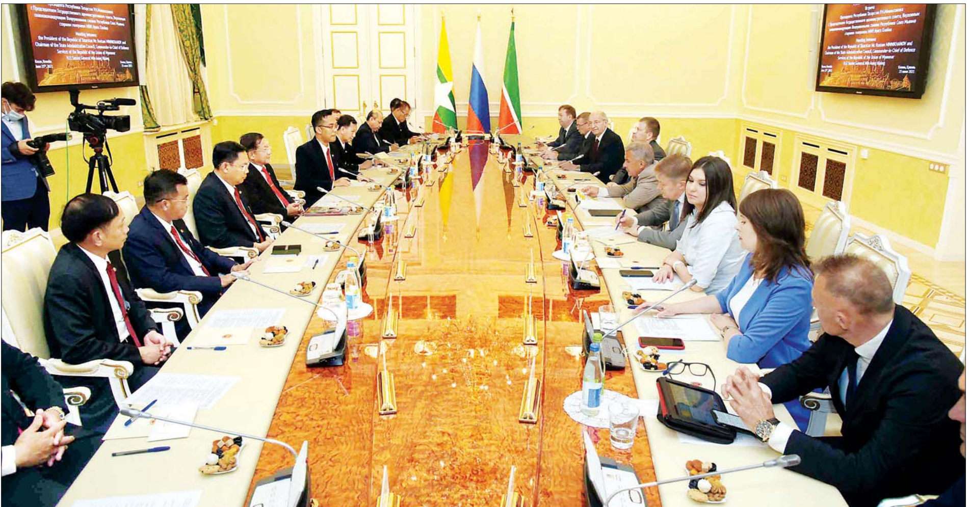
နိုင်ငံတော်စီမံအုပ်ချုပ်ရေးကောင်စီဥက္ကဋ္ဌ၊ တပ်မတော်ကာကွယ်ရေးဦးစီးချုပ် ဗိုလ်ချုပ်မှူးကြီး မင်းအောင်လှိုင် Republic of the Tatarstan သမ္မတ Mr. Rustam Nurgaliyevich Minnikhanov နှင့် တွေ့ဆုံဆွေးနွေးစဉ်။