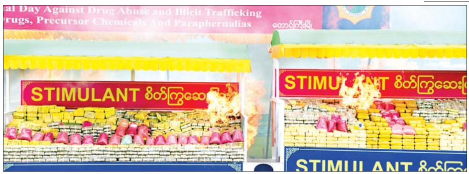
တောင်ကြီးမြို့၌ ဖမ်းဆီးရမိသည့် မူးယစ်ဆေးဝါးနှင့် ဓာတုပစ္စည်းများအား မီးရှို့ဖျက်ဆီးစဉ်။