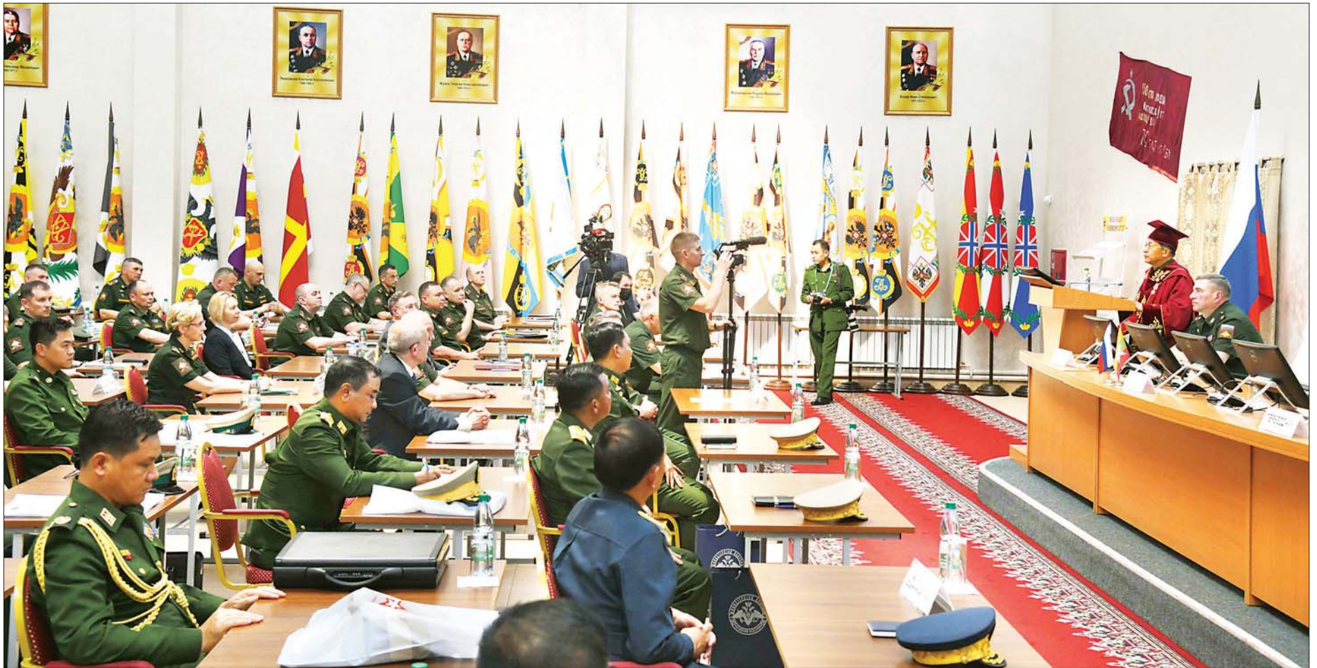
နိုင်ငံတော်စီမံအုပ်ချုပ်ရေးကောင်စီဥက္ကဋ္ဌ၊ တပ်မတော်ကာကွယ်ရေးဦးစီးချုပ် ဗိုလ်ချုပ်မှူးကြီး မင်းအောင်လှိုင် ရုရှားဖက်ဒရေးရှင်းနိုင်ငံ၊ စစ်ဘက်ဆိုင်ရာတက္ကသိုလ်မှ “ဂုဏ်ထူးဆောင်ပါမောက္ခ”ဘွဲ့ ပေးအပ်ချီးမြှင့်ခြင်းအခမ်းအနားတွင် ကျေးဇူးတင်စကား ပြောကြားစဉ်။