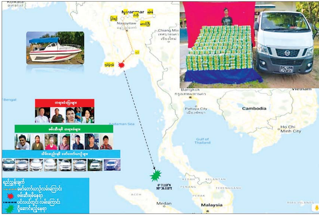
ကွမ်းခြံကုန်းမြို့နယ် ဆယ်အိမ်တန်းကျေးရွာတွင် ဖမ်းဆီးရမိသော တရားခံများနှင့် မူးယစ်ဆေးဝါးများ။

ပစ္စည်းများသည် နည်းလမ်းအမျိုးမျိုး ပုံသဏ္ဍာန်အမျိုးမျိုးဖြင့် မြန်မာနိုင်ငံအတွင်း တရားမဝင် တင်သွင်းလျက်ရှိသည်ကို ဖမ်းဆီးရမိမှုများအရ တွေ့ရှိရပါသည်။ တရားဝင် တင်သွင်းမှုမှ လမ်းလွဲရောက်ရှိမှု မရှိစေရေးနှင့် တရားမဝင်တင်သွင်းမှု မရှိစေရေး ပို့ကုန် ကြိုတင်သတင်းပေးစနစ် (Pre-Export Notification-PEN) စနစ်ကို အသုံးပြုကာ ပြည်ပနိုင်ငံများနှင့် ဆက်သွယ်ဆောင်ရွက်လျက်ရှိပါသည်။ မြန်မာနိုင်ငံတွင် ထိန်းချုပ်ဓာတုပစ္စည်း ၃၉ မျိုးကို ထိန်းချုပ်ဆောင်ရွက်ခြင်းဖြင့် မူးယစ်ဆေးဝါး ကြိုတင်ကာကွယ်ရေး လုပ်ငန်းများ ဆောင်ရွက်လျက်ရှိပါသည်။ စံချိန်စံညွှန်းနှင့်အညီ မြန်မာနိုင်ငံ မူးယစ်ဆေးဝါးနှင့်