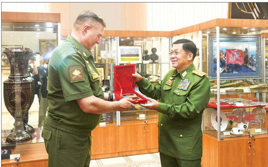
နိုင်ငံတော်စီမံအုပ်ချုပ်ရေးကောင်စီဥက္ကဋ္ဌ၊ တပ်မတော်ကာကွယ်ရေးဦးစီးချုပ် ဗိုလ်ချုပ်မှူးကြီး မင်းအောင်လှိုင် ရုရှားဖက်ဒရေးရှင်းနိုင်ငံ၊ စစ်တက္ကသိုလ်မှ ကျောင်းအုပ်ကြီး ဒုတိယဗိုလ်ချုပ်ကြီး အီဂေါ့ဗ်သီကင် အား လက်ဆောင်ပစ္စည်းပေးအပ်စဉ်။

စစ်တက္ကသိုလ်မှ ဂုဏ်ပြုတပ်ဖွဲ့က နှစ်နိုင်ငံ နိုင်ငံတော် သီချင်းကို ဂုဏ်ပြုတီးမှုတ်ကြသည်။ ဆက်ဆံရေးတိုးမြှင့်ဆောင်ရွက် ထိုနောက် နိုင်ငံတော်စီမံအုပ်ချုပ်ရေးကောင်စီ ဥက္ကဋ္ဌ၊ တပ်မတော်ကာကွယ်ရေးဦးစီးချုပ်က ယခု ကဲ့သို့ “ဂုဏ်ထူးဆောင်ပါမောက္ခ” ပေးအပ်ချီးမြှင့်ခြင်း ခံရသည့်အတွက် ဂုဏ်ယူဝမ်းမြောက်ကြောင်းနှင့် ကျေးဇူးတင်စကားပြောကြားရာတွင် ရုရှားဖက်ဒရေးရှင်းနိုင်ငံ၏ သမိုင်းကြောင်းကောင်းမွန်လှသည့် ယခုစစ်တက္ကသိုလ်မှ ချီးမြှင့်သည့် ဂုဏ်ထူးဆောင် ပါမောက္ခဘွဲ့ကို လက်ခံရရှိခဲ့သည့်အတွက် အထူးပင် ဝမ်းမြောက်ဂုဏ်ယူမိပါကြောင်း၊ ဂုဏ်ထူးဆောင် ပါမောက္ခ၏ ဂုဏ်ဒြပ်နှင့်အညီ ရုရှား-မြန်မာ စစ်ဘက် ဆိုင်ရာ ပူးပေါင်းဆောင်ရွက်မှုလုပ်ငန်းများ၊ နှစ်နိုင်ငံ စစ်ဘက်-အရပ်ဘက် လူမှုအဖွဲ့အစည်းအတွက် အကျိုးရှိစေမည့်ကိစ္စရပ်များ၊ ယဉ်ကျေးမှု၊ စစ်ဘက် နည်းပညာနှင့် သိပ္ပံနည်းပညာရပ်ဆိုင်ရာများ ဖွံ့ဖြိုး