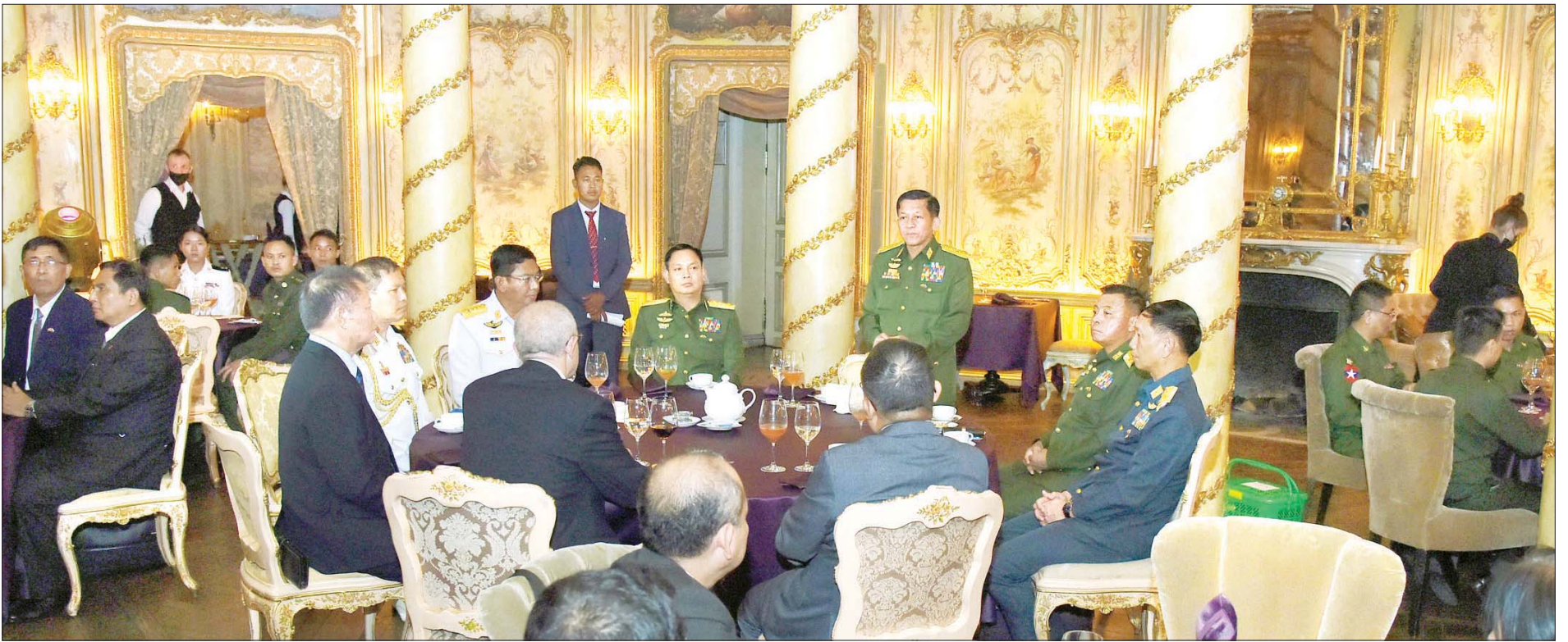
နိုင်ငံတော်စီမံအုပ်ချုပ်ရေးကောင်စီဥက္ကဋ္ဌ တပ်မတော်ကာကွယ်ရေးဦးစီးချုပ် ဗိုလ်ချုပ်မှူးကြီး မင်းအောင်လှိုင် ရုရှားဖက်ဒရေးရှင်းနိုင်ငံ၊ မြန်မာသံရုံးနှင့် မြန်မာစစ်သံ (ကြည်း၊ ရေ၊ လေ) ရုံး မိသားစုများနှင့် ပညာတော်သင် သင်တန်းသားများအား တွေ့ဆုံအမှာစကား ပြောကြားစဉ်။