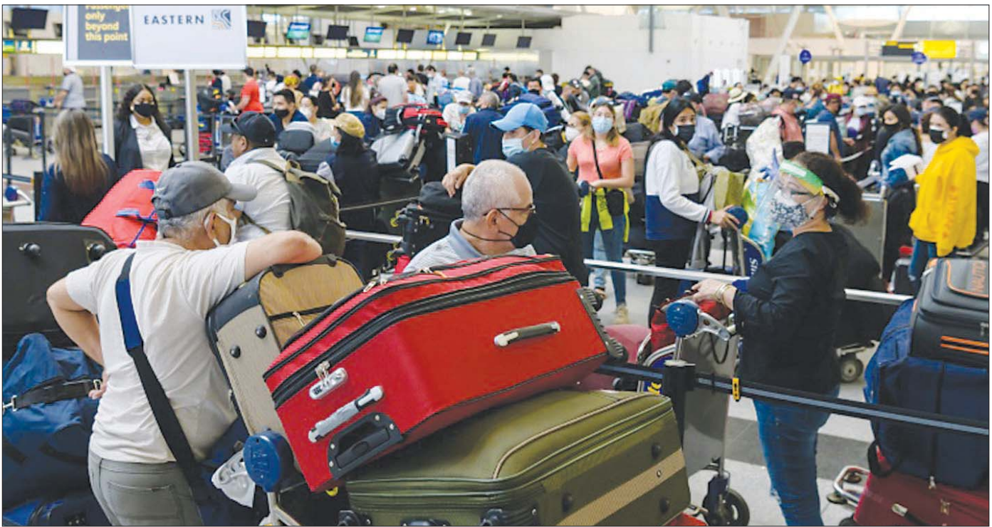
ပျံအင်္ဂါဖ် ကနေဒါလေဆိပ်တွင် စောင့်ဆိုင်းနေကြသည့် ခရီးသွားများကို မေ ၂၈ ရက်က တွေ့ရစဉ်။

ခရီးသွားလာခွင့်နှင့်ပတ်သက်၍ အမေရိကန်ဘက်မှ တင်းကျပ်မှုများ လုပ်ဆောင်ထားသော်လည်း ဥရောပသမဂ္ဂကမူ အမေရိကန်နှင့် ခရီးသွားလာခွင့်အတွက် လမ်းဖွင့်ပေးရန် ဆုံးဖြတ်ခဲ့သည်။ ကာကွယ်ဆေး အပြည့်အဝထိုးပြီးသူ သို့မဟုတ် ဆေးစစ်ချက် လက်မှတ်တွင် ရောဂါကင်းစင်ကြောင်း ပြသနိုင်သူ