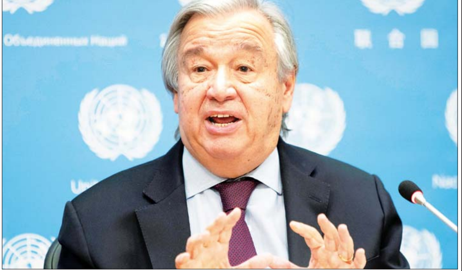
အကြမ်းဖက်လုပ်ရပ်များ၊ အမုန်းစကားပြော အတွင်း လုံးဝမလုပ်ကြရန် ၎င်းက ဆက်လက် ကြားမှုများကိုလည်း ရွေးကောက်ပွဲ လုပ်ငန်းစဉ် တိုက်တွန်းပြောကြားထားသည်။ ဆင်ဟွာ

အမျိုးသမီးများ၊ လူငယ်များ၊ ရွှေ့ပြောင်းနေထိုင်သူများအပါအဝင် လစ်ဗျားနိုင်ငံသူ နိုင်ငံသားများအနေဖြင့် ဒီဇင်ဘာ ၂၄ ရက်နေ့ ကျင်းပမည့် ရွေးကောက်ပွဲတွင် မဲဆန္ဒရှင်များအဖြစ် လွတ်လပ်စွာ ပါဝင်ကြရန်လည်း ဂူတာရဲစ်က တိုက်တွန်း ပြောကြားလိုက်သည်။