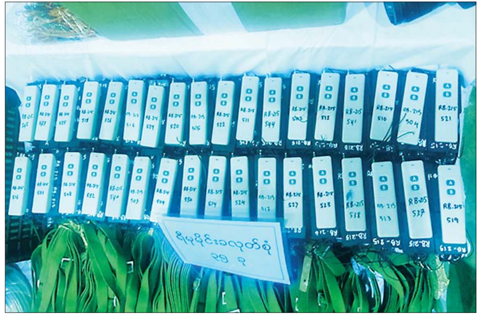
သိမ်းဆည်းရမိသည့် Remote မိုင်းခလုတ်များကို တွေ့ရစဉ်။

လက်နက်မျိုးစုံနှင့် ဗုံးသီးများ ဖမ်းဆီးရမိ ဖမ်းဆီးရမိတရားခံများကို ဆက်လက်စစ်ဆေး မေးမြန်းချက်အရ လက်နက်/ ခဲယမ်းများကို ခြောက်ဘီးယာဉ်တစ်စီးဖြင့်သယ်ဆောင်လာကြောင်း သိရှိရသဖြင့် ဖမ်းဆီးရမိရေးဆောင်ရွက်ခဲ့ရာ ညနေပိုင်းတွင် မန္တလေး-ဗန်းမော်ကားလမ်း မိုင်တိုင်အမှတ်(၂၅) ဝါးရုံကုန်းကျေးရွာ၌ Nissan အမျိုးအစား ယာဉ်အမှတ်၊ 8B-9757 ခြောက်ဘီးယာဉ်ဖြင့် သယ်ဆောင်လာသော K 2-5 အရှည် ၃၂ လက်၊ K 2-5(ခေါက်ဒင်) ၃၂ လက်၊ M-79 LL အလက် ၄၀၊ 779 Pading III-S ၁၀ လက် စုပေါင်းလက်နက်မျိုးစုံ ၁၁၄ လက်၊ ကျည်အိမ် ၂၄၈ ခု၊ K 2-5 ကျည် အတောင့် ၁၀၀၀၀၊ လက်ပစ်ဗုံး ၄၉၉ လုံး၊ ၄၀ မမ ဗုံးသီး ၁၄၇၃ လုံး၊ Remote Control မိုင်းအဝေးထိန်းခလုတ် ၃၅ ခု၊ ယမ်းမှုန့်ဟုယူဆရသော အထုပ် ၂၅ ထုပ် (၄ ဒသမ ၉၆၅ ကီလိုဂရမ်)၊ လွယ်ကြိုး အချောင်း ၁၅၀၊ လျှပ်စစ်စနက်တံတစ်ခွေနှင့် ဒီတိုနေတာ