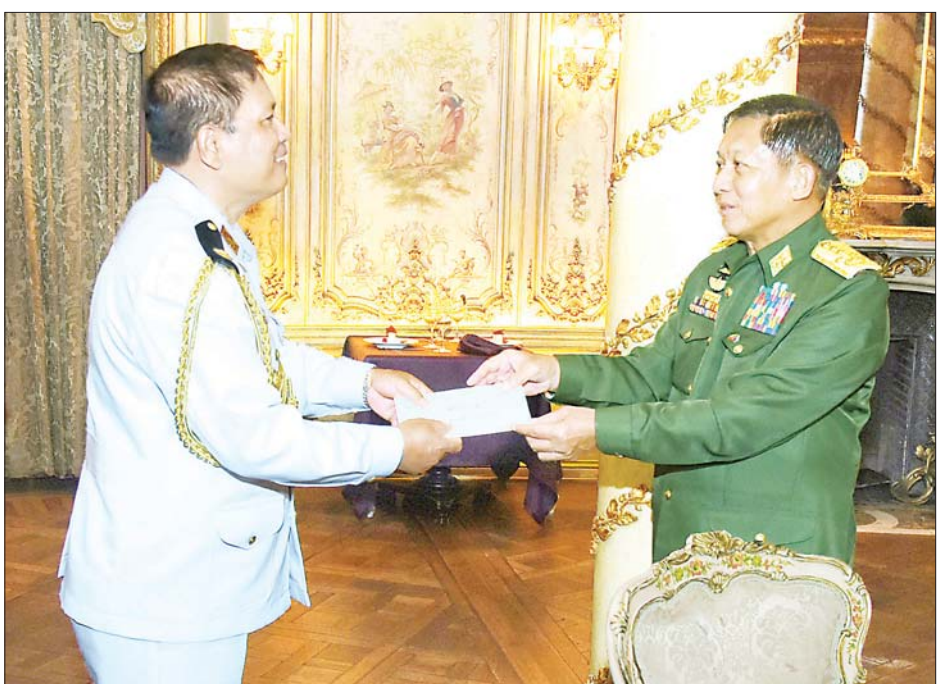
နိုင်ငံတော်စီမံအုပ်ချုပ်ရေးကောင်စီဥက္ကဋ္ဌ တပ်မတော်ကာကွယ်ရေးဦးစီးချုပ် ဗိုလ်ချုပ်မှူးကြီး မင်းအောင်လှိုင် သံရုံး၊ စစ်သံရုံးမိသားစုများအတွက် ချီးမြှင့်ငွေများ ပေးအပ်စဉ်။

အမြဲမပြတ် လေ့လာအားထုတ် ဆက်လက်ပြီး နိုင်ငံအချင်းချင်း ဆက်ဆံရာတွင် သံတမန်ဆက်ဆံရေးသည် များစွာအရေးပါသောကြောင့် သံရုံး၊ စစ်သံရုံးများတွင် နိုင်ငံ့တာဝန်ထမ်းဆောင်နေကြသူများအနေဖြင့် စည်းလုံးညီညွတ်စွာဖြင့် ဝိုင်းဝန်းပူးပေါင်းဆောင်ရွက်ကြရန် လိုအပ်မည်ဖြစ်ကြောင်း၊ သံရုံး၊ စစ်သံရုံးမိသားစုများအပြင် ပညာတော်သင် သင်တန်းသားများအနေဖြင့်လည်း သင်ကြားပေးသည့် အတတ်ပညာများကို အလေး