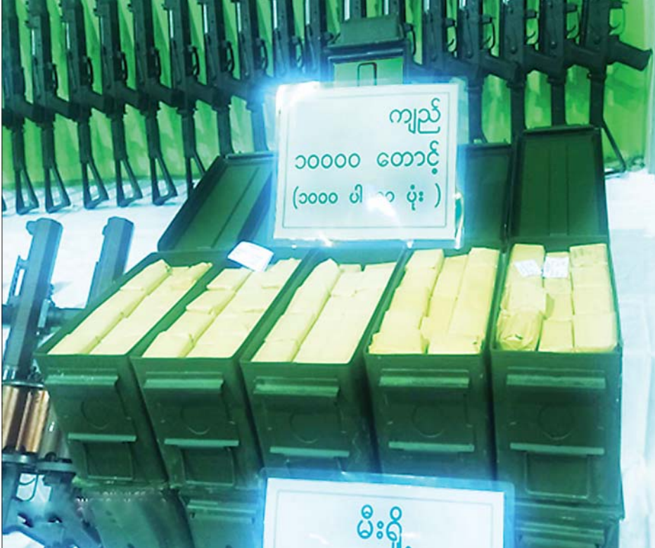
သိမ်းဆည်းရမိသည့် K 2-5 ကျည်များကို တွေ့ရစဉ်။

မန္တလေးသို့ ဦးစွာထွက်ခွာခဲ့ပြီး ဝေယံလင်း(ခ) ထွန်းတောက်နိုင်အပါ လေးဦးသည် နောက်မှ လိုက်ပါလာခဲ့ရာ သပိတ်ကျင်းမြို့နယ် တကောင်းမြို့ လမ်းဆုံ၌ ဖမ်းဆီးခံရပြီး လက်နက်များသယ်ဆောင် လာသော ခြောက်ဘီးယာဉ်ကို မန္တလေး-ဗန်းမော် ကားလမ်း မိုင်တိုင်အမှတ်(၂၅)၊ ဝါးရုံကုန်းကျေးရွာ အနီး၌ ထပ်မံဖမ်းဆီးရမိခဲ့ကြောင်း သိရှိရသည်။ လုံခြုံရေးလုပ်ငန်းများ တိုးမြှင့်ဆောင်ရွက် အကြမ်းဖက်သူများအနေဖြင့် မြို့နယ်တစ်ချို့ အတွင်း အများပြည်သူအား ထိတ်လန့်တုန်လှုပ် ချောက်ချားစေ၍ မြို့ရွာတည်ငြိမ်အေးချမ်းမှုကို ပျက်ပြားစေရန်နှင့် လုံခြုံရေးတပ်ဖွဲ့ဝင်များ တာဝန် ထမ်းဆောင်မှုမပြုနိုင်စေရန် ထိခိုက်သေကျစေရန် ရည်ရွယ်၍ လက်လုပ်ဗုံးများအပြင် မောင်းပြန်ရိုင်းဖယ် များပါအသုံးပြု၍ တိုက်ခိုက်သတ်ဖြတ်ခြင်း၊ လက်နက်ကိုင်အဖွဲ့များဖြင့်ဆက်သွယ်၍ သင်တန်း များ တက်ရောက်ခြင်း၊ ဝိုင်းရံခြင်း၊ လက်နက်/ ခဲယမ်းများ စုဆောင်းခြင်း၊ လူအင်အားစုဆောင်းခြင်း များကိုပါ ပြုလုပ်လာလျက်ရှိကြောင်းနှင့် အကြမ်း ဖက်သူများ ခိုအောင်းနေထိုင် လှုပ်ရှားမှုမရှိစေရေး အတွက် လုံခြုံရေးလုပ်ငန်းများကို တိုးမြှင့် ဆောင်ရွက်လျက်ရှိပြီး ဆက်စပ်တရားခံများကို အမြန်ဆုံးဖမ်းဆီးရမိရေး မြို့ရွာအမြန်ဆုံးအေးချမ်း တည်ငြိမ်ရေးအတွက် ပြည်သူတစ်ရပ်လုံး ပူးပေါင်း ပါဝင်ကြိုးပမ်းဆောင်ရွက်နိုင်ပါရန် မေတ္တာရပ်ခံ အပ်ပါကြောင်းနှင့် ဖြစ်စဉ်ပါ ဖမ်းဆီးရမိတရားခံ များကို ဥပဒေနှင့်အညီ အရေးယူဆောင်ရွက်မှုများ ပြုလုပ်၍ ကွင်းဆက်တရားခံများကို ဆက်လက် ဖော်ထုတ်ဖမ်းဆီးခြင်းများ ဆောင်ရွက်သွားမည် ဖြစ်ကြောင်း သတင်းရရှိသည်။