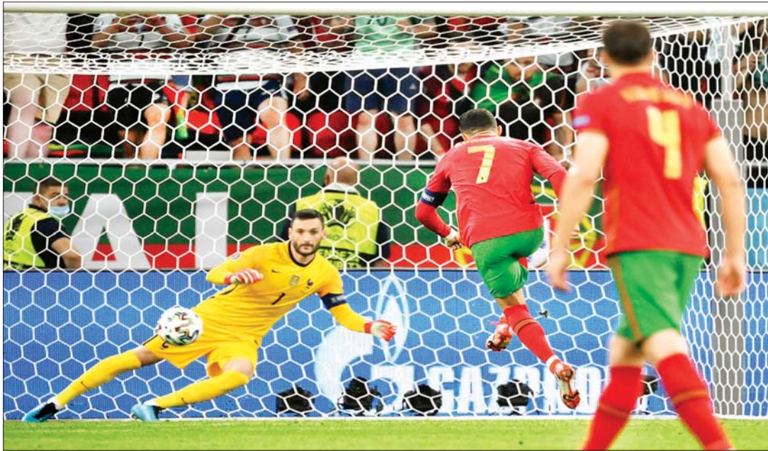
ပေါ်တူဂီအသင်းအတွက် အသင်းခေါင်းဆောင် စီရော်နယ်ဒို ပယ်နယ်တီမှတစ်ဆင့် ဂိုးသွင်းယူစဉ်။

ယူရို ၂၀၂၀ ချန်ပီယံရှစ်ပြိုင်ပွဲ ပွဲစဉ် (၃) အဖြစ် အုပ်စု (F) မှ ယူရိုလက်ရှိချန်ပီယံ ပေါ်တူဂီ အသင်းနှင့် ကမ္ဘာ့လားချန်ပီယံ ပြင်သစ်အသင်းတို့ ယှဉ်ပြိုင်ကစားခဲ့ရာ တစ်ဖက် နှစ်ဂိုးစီဖြင့် သရေကျခဲ့သည်။ ပေါ်တူဂီအသင်းအတွက် သွင်းဂိုးများကို စီရော်နယ်ဒိုက သွင်းယူပေးပြီး ပြင်သစ်အသင်းအတွက် သွင်းဂိုးများကို ဘင်ဇီမာက သွင်းယူပေးနိုင်ခဲ့သည်။ ပြင်သစ်အသင်းသည် ယူရိုပြိုင်ပွဲတွင် သုံးပွဲကစား တစ်ပွဲနိုင်၊ နှစ်ပွဲသရေ ရမှတ်ငါးမှတ်ဖြင့် အုပ်စုပထမရရှိကာ နောက်တစ်ဆင့်သို့ တက်ရောက်ခဲ့သည်။ ပြိုင်ဘက် ပေါ်တူဂီအသင်း ကလည်း ယနေ့ ပွဲစဉ်တွင် သရေကျခဲ့သောကြောင့် သုံးပွဲကစား တစ်ပွဲနိုင်၊ တစ်ပွဲသရေ တစ်ပွဲရှုံး ရမှတ်လေးမှတ်ဖြင့် အကောင်းဆုံးအုပ်စု တတိယရရှိကာ ယူရိုပြိုင်ပွဲ နောက်တစ်ဆင့်သို့ တက်ရောက်နိုင်ခဲ့သည်။ စာမျက်နှာ ၂၅ ကော်လံ ၁ ●