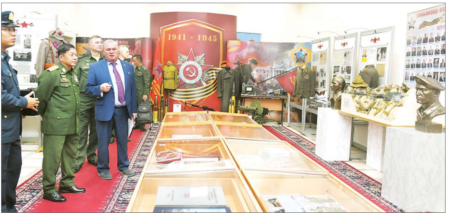
နိုင်ငံတော်စီမံအုပ်ချုပ်ရေးကောင်စီဥက္ကဋ္ဌ၊ တပ်မတော်ကာကွယ်ရေးဦးစီးချုပ် ဗိုလ်ချုပ်မှူးကြီး မင်းအောင်လှိုင် ရုရှားဖက်ဒရေးရှင်းနိုင်ငံ၊ စစ်ဘက်ဆိုင်ရာ တက္ကသိုလ် ကျောင်းပြတိုက်၌ ကြည့်ရှုလေ့လာစဉ်။

အစိုးရနှစ်ရပ်အကြား ချစ်ကြည်ရင်းနှီးမှုကို တိုးတက်ခိုင်မာအောင် စွမ်းဆောင်နိုင်မှုတို့ကြောင့် စစ်တက္ကသိုလ်မှ ဘုတ်အဖွဲ့များ၏ ဆုံးဖြတ်ချက်အရ ဂုဏ်ထူးဆောင်ပါမောက္ခဘွဲ့ ပေးအပ်ချီးမြှင့်ခြင်း ဖြစ်ကြောင်း ရှင်းလင်းပြောကြားသည်။ ထို့နောက် ကျောင်းအုပ်ကြီးက ရုရှားဖက်ဒရေးရှင်းနိုင်ငံ၊ စစ်ဘက်ဆိုင်ရာတက္ကသိုလ် (Military University of Defence Ministry) ၏ “ဂုဏ်ထူးဆောင်ပါမောက္ခ”ဘွဲ့ (Honorary Professor of the Russian Military University) အဆောင်အယောင်များဖြစ်ကြသည့် ဘွဲ့ဝတ်ရုံ၊ ခေါင်းဆောင်း၊ ဘွဲ့တံဆိပ်၊ ဘွဲ့လက်မှတ် နှင့် ဂုဏ်ပြုမှတ်တမ်းလွှာတို့ကို ပေးအပ်ချီးမြှင့်ရာ နိုင်ငံတော်စီမံအုပ်ချုပ်ရေးကောင်စီဥက္ကဋ္ဌ၊ တပ်မတော် ကာကွယ်ရေးဦးစီးချုပ်က လက်ခံရယူသည်။ ထို့ပြင် စစ်တက္ကသိုလ်၏ နှစ် ၁၀၀ ပြည့် အထိမ်းအမှတ် ရင်ထိုးတံဆိပ်ကိုလည်း ဂုဏ်ပြုတပ်ဆင်ပေးသည်။ ဂုဏ်ထူးဆောင်ဘွဲ့ချီးမြှင့်နေစဉ်အတွင်း အဆိုပါ