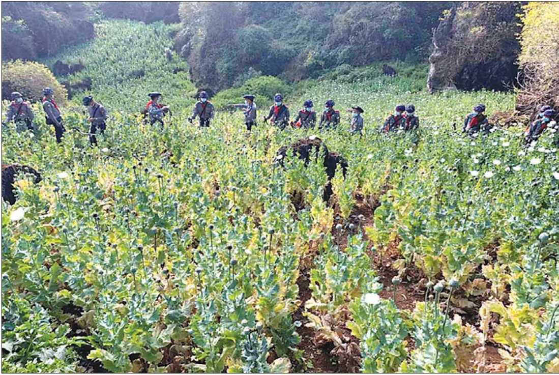
ရမ်းပြည်နယ်တောင်ပိုင်း ပင်လောင်းမြို့နယ်အတွင်း ဘိန်းခင်းများကို ဖျက်ဆီးစဉ်။

ဘိန်းစိုက်ပျိုးထုတ်လုပ်မှု ကျဆင်းလာမှုနှင့်အတူ ဘိန်းအခြေခံမူးယစ်ဆေးဝါးထုတ်လုပ်မှုမှာလည်း ကျဆင်းလာခဲ့သည်။ သို့ရာတွင် မူးယစ်ဆေးဝါးထုတ်လုပ်ရာ၌ မရှိမဖြစ် လိုအပ်သော ပရိုကာဆာဓာတု အစပြုကုန်ကြမ်းများ တရားမဝင် သယ်ဆောင်ရောင်းဝယ်မှုမှာ မြင့်မားလာလျက်ရှိသည်။ ဒေသတွင်း စိတ်ပြောင်းဆေးဝါးထုတ်လုပ်မှု မြင့်မားလာမှုကြောင့် မူးယစ်ဆေးဝါးဖမ်းဆီးရရှိမှု တိုးမြှင့်လာသော်လည်း အသွင်ပြောင်းလာသော လူလုပ်မူးယစ်ဆေးဝါး (synthetic drug) ထုတ်လုပ်မှုကျဆင်းခြင်း မရှိဘဲ ဈေးနှုန်းသက်သာပြီး အရည်အသွေးပိုမိုကောင်းမွန်သော မူးယစ်ဆေးဝါးတို့ကို ပိုမိုထုတ်လုပ်လာလျက်ရှိသည်။ ထိုသို့ ထုတ်လုပ်နိုင်ရန် ဈေးကွက်သဖွယ် ဖြစ်ပေါ်လာသော ဓာတုကုန်ကြမ်း ပစ္စည်းများ အရေးပါလျက်ရှိပြီး အသွင်ပြောင်းလဲလာသော လူလုပ်မူးယစ်ဆေးဝါး ထုတ်လုပ်ရာ