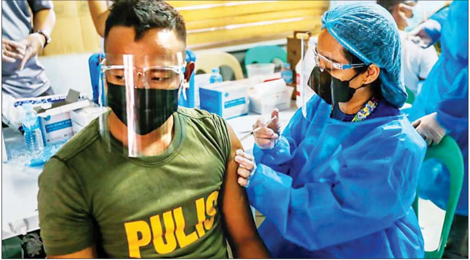
ဖိလစ်ပိုင်နိုင်ငံ နာဗီတာမြို့တွင် အမျိုးသားတစ်ဦး ကိုဗစ်-၁၉ ကာကွယ်ဆေးထိုးမှု ခံယူနေစဉ်။