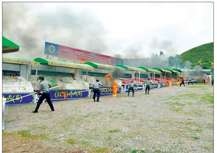
တောင်ကြီးမြို့၌ ဖမ်းဆီးရမိ မူးယစ်ဆေးဝါးများကို မီးရှို့ဖျက်ဆီးနေစဉ်။

မြန်မာနိုင်ငံသည် ကမ္ဘာပေါ်တွင် တရားမဝင်ဘိန်းစိုက်ပျိုးထုတ်လုပ်သော နိုင်ငံတစ်ခုဖြစ်ပြီး နိုင်ငံတော်အစိုးရ အဆက်ဆက်နှင့် ပြည်သူလူထု ပူးပေါင်း ဆောင်ရွက်မှုဖြင့် တရားမဝင် ဘိန်းစိုက်ပျိုးမှုများ လျော့ကျလာခဲ့သည်။ ၁၉၉၆ ခုနှစ်တွင် ဘိန်းစိုက်ပျိုးမှု ဟက်တာ ၁၆၃၀၀ ရှိခဲ့ရာမှ ၂၀၁၉ ခုနှစ်တွင် ဘိန်းစိုက်ပျိုးမှုမှာ ဟက်တာ ၃၃၀၀ ရှိခဲ့ပြီး ၂၀၂၀ ပြည့်နှစ်တွင် ဟက်တာ ၂၉၅၀ ရှိခဲ့ရာ ၂၀၁၉ ခုနှစ်ထက် ၁၁ ရာခိုင်နှုန်း ကျဆင်းခဲ့သည်။ ၂၀၁၉ ခုနှစ်တွင် ဘိန်းထုတ်လုပ်မှုအနေဖြင့် ၅၈၀ မက်ထရစ်တန်ရှိပြီး ၂၀၂၀ ပြည့်နှစ်တွင် ၄၀၅ မက်ထရစ်တန်သာရှိရာ ၂၀၁၉ ခုနှစ်ထက် ၂၀ ရာခိုင်နှုန်း သိသိသာသာ ကျဆင်းခဲ့သည်။ ထို့အပြင် တရားမဝင် ဘိန်းခင်းများကို ၂၀၁၉-၂၀၂၀ ဘိန်းစိုက်ရာသီတွင် ၂၀၂၆ ဒဿ ၅၈ ဟက်တာနှင့် ၂၀၂၀-၂၀၂၁ ဘိန်းစိုက်ရာသီတွင် ၄၆၃၂ ဒဿ ၉၇၇ ဟက်တာ ဖျက်ဆီးနိုင်ခဲ့သည်။ ၂၀၁၄ ခုနှစ်မှစ၍ ဘိန်းစိုက်ပျိုးထုတ်လုပ်မှု တစ်နှစ်ထက်တစ်နှစ် ကျဆင်းလာခြင်းသည် နိုင်ငံတော်အစိုးရနှင့် ဒေသပြည်သူတို့ ပူးပေါင်း ဆောင်ရွက်မှု၊ နိုင်ငံတကာအဖွဲ့အစည်းများ၊ ကုလသမဂ္ဂလက်အောက်ခံအဖွဲ့အစည်းဖြစ်သော UNODC တို့နှင့် ပူးပေါင်း ဆောင်ရွက်မှုကြောင့်ဖြစ်သည်။ မြန်မာနိုင်ငံသည် တရားမဝင် ဘိန်းစိုက်ပျိုးထုတ်လုပ်မှုမှာ တတိယအဆင့်သို့ ကျဆင်းခဲ့သော်လည်း ဒေသတွင်းနိုင်ငံများနည်းတူ လူလုပ်မူးယစ်ဆေးဝါးများ ထုတ်လုပ်သယ်ဆောင်ရောင်းဝယ်မှုနှင့် သုံးစွဲမှု ပြဿနာများစွာ ကြုံတွေ့နေလျက်ရှိသည်။ ထို့အပြင် မူးယစ်ဆေးဝါးချက်လုပ်ရာတွင် အဓိကကျသော ပရိုကာဆာဓာတုပစ္စည်းများ နယ်စပ်ဖြတ်ကျော်သယ်ဆောင်ခြင်းနှင့် မူးယစ်ဆေးဝါးသုံးစွဲမှုနှင့် ဆက်စပ်သော နောက်ဆက်တွဲအန္တရာယ်များ မြင့်တက်လာမှုကို ရင်ဆိုင်လာလျက်ရှိသည်။