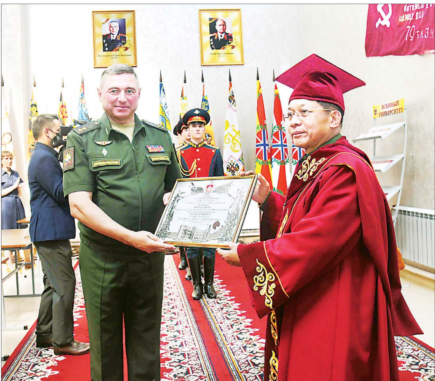
နိုင်ငံတော်စီမံအုပ်ချုပ်ရေးကောင်စီဥက္ကဋ္ဌ၊ တပ်မတော်ကာကွယ်ရေးဦးစီးချုပ် ဗိုလ်ချုပ်မှူးကြီး မင်းအောင်လှိုင် အား စစ်တက္ကသိုလ်မှ ကျောင်းအုပ်ကြီး ဒုတိယဗိုလ်ချုပ်ကြီး အီဂေါမီရှုသ်ကင် က ရုရှားဖက်ဒရေးရှင်းနိုင်ငံ၊ စစ်ဘက်ဆိုင်ရာတက္ကသိုလ်၏ “ဂုဏ်ထူးဆောင်ပါမောက္ခ” ဘွဲ့ အဆောင်အယောင်များ ဖြစ်ကြသည့် ဘွဲ့ဝတ်ရုံ၊ ခေါင်းဆောင်း၊ ဘွဲ့တံဆိပ်၊ ဘွဲ့လက်မှတ်နှင့် ဂုဏ်ပြုမှတ်တမ်းလွှာတို့ကို ပေးအပ်ချီးမြှင့်စဉ်။

ယင်းနောက် စစ်တက္ကသိုလ်မှ ကျောင်းအုပ်ကြီး ဒုတိယဗိုလ်ချုပ်ကြီး အီဂေါမီရှုသ်ကင် (Lieutenant General Lgor Mishutkin) က နိုင်ငံတော်စီမံအုပ်ချုပ်ရေးကောင်စီဥက္ကဋ္ဌ၊ တပ်မတော်ကာကွယ်ရေးဦးစီးချုပ်အား နှစ်နိုင်ငံတပ်မတော်နှစ်ရပ်အကြား ဆက်ဆံရေးတိုးတက်ခိုင်မာအောင် ဆောင်ရွက်နိုင်မှု၊ စစ်ဘက်နည်းပညာဆိုင်ရာ ဖွံ့ဖြိုးတိုးတက်ရေးပူးပေါင်းဆောင်ရွက်မှု၊ ပညာတော်သင် သင်တန်းသားများကို စေလွှတ်ခြင်းဖြင့် နှစ်နိုင်ငံတပ်မတော်နှင့် စာမျက်နှာ ၃ ကော်လံ ၁