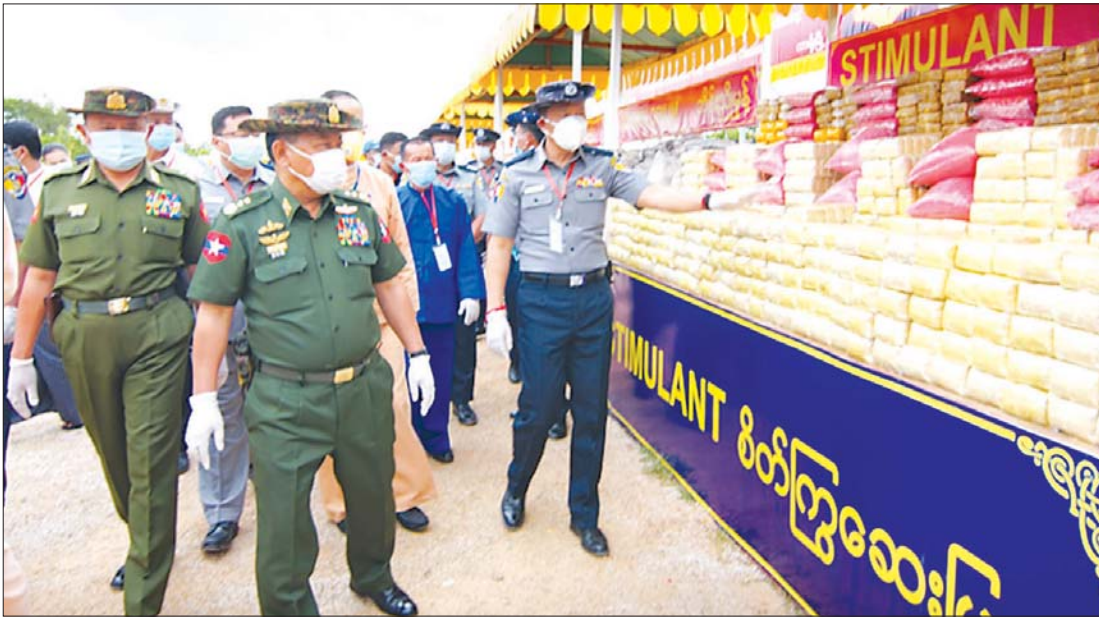
ပြည်ထောင်စုဝန်ကြီး ဒုတိယဗိုလ်ချုပ်ကြီး စိုးထွဋ် လားရှိုးမြို့၌ပြုလုပ်သော ၂၀၂၀ ပြည့်နှစ် အပြည်ပြည်ဆိုင်ရာ မူးယစ်ဆေးဝါးအလွဲသုံးမှုနှင့် တရားမဝင်ရောင်းဝယ်မှုတိုက်ဖျက်ရေးနေ့အထိမ်းအမှတ်အခမ်းအနား၌ မီးရှို့ဖျက်ဆီးမည့် မူးယစ်ဆေးဝါးများကို ကြည့်ရှုစစ်ဆေးစဉ်။

ဘိန်းပင်သည် ကျောက်ခေတ် ကာလက မြေထဲပင်လယ်အနီး တောင်တန်းများပေါ်တွင် သဘာဝအလျောက် ပေါက်ရောက်ခဲ့သော အပင်ဖြစ်ကြောင်း ပညာရှင်တို့က သုံးသပ်ခဲ့သည်။ ဘိန်းပင်ကို BC ၃၄၀၀ ခန့်က မက်ဆိုပိုတေးမီးယား ဒေသ(ယခု အီရတ်နိုင်ငံ Euphrates မြစ်နှင့် Tigirs မြစ်ဝှမ်းဒေသ)တွင် စတင်စိုက်ပျိုးခဲ့ကြောင်း သမိုင်းရှိခဲ့ပြီး ထိုမှတစ်ဆင့် ဥရောပအလယ်ပိုင်းနှင့် အီဂျစ်သို့ ပျံ့နှံ့ရောက်ရှိခဲ့သည်။ ဘိန်းကို ခရစ်တော်မပေါ်မီ နှစ် ၁၀၀၀ ခန့်က ဆေးဝါးအဖြစ် နာကျင်ကိုက်ခဲမှုနှင့် ဝမ်းကိုက်ပျောက်ဆေးအဖြစ် အသုံးပြုခဲ့ရာမှ သုံးစွဲမှုများလာပြီး ဘိန်းကို နှစ်သက်စွဲလမ်းလာခြင်း ဖြစ်သည်။