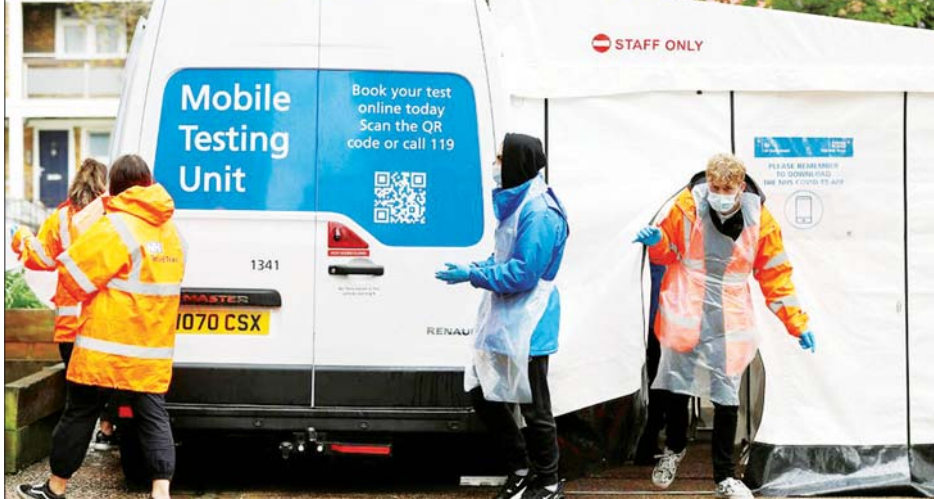
ဗြိတိန်နိုင်ငံ လန်ဒန်၌ ရွှေ့ပြောင်းကိုဗစ်-၁၉ စမ်းသပ်ယာဉ်နှင့်အတူ ဝန်ထမ်းများကို တွေ့ရစဉ်။

ဖြစ်ကြောင်း သိရသည်။ အိန္ဒိယနိုင်ငံတွင် ပထမဆုံး တွေ့ရှိခဲ့သည့် ဒယ်လ်တာ ကိုဗစ်-၁၉ မျိုးစိတ်သည် ဗြိတိန်၏ ကိုဗစ်-၁၉ ထပ်မံကူးစက် ဖြစ်ပွားမှု၏ အဓိက တရားခံဖြစ်သည်။ ယခုအခါ နောက်ထပ် ဒယ်လ်တာ ပလက်စ်ဟု အမည်ပေးထားသော ကိုဗစ်-၁၉ မျိုးစိတ်သည်တစ်မျိုး သည် ကိုဗစ်-၁၉ ကူးစက်ဖြစ်ပွားမှုကို ပိုမိုဖြစ်ပွားစေနိုင်သည့်အပေါ် သုတေသီများက စိုးရိမ်လျက် ရှိသည်။ ဆင်ဟွာ