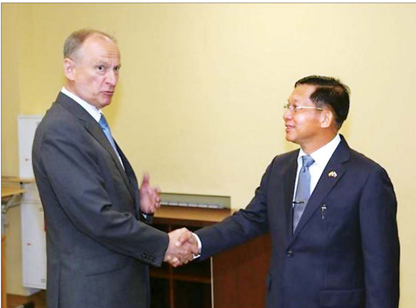
နိုင်ငံတော်စီမံအုပ်ချုပ်ရေးကောင်စီဥက္ကဋ္ဌ၊ တပ်မတော်ကာကွယ်ရေးဦးစီးချုပ် ဗိုလ်ချုပ်မှူးကြီး မင်းအောင်လှိုင် ရုရှားဖက်ဒရေးရှင်းနိုင်ငံ၊ လုံခြုံရေးကောင်စီ အတွင်းရေးမှူး Mr.Nikolai Platonovich Patrushev အား ရင်းရင်းနှီးနှီးနှုတ်ဆက်စဉ်။

ထိုသို့တွေ့ဆုံစဉ် နှစ်နိုင်ငံအစိုးရနှစ်ရပ်အကြား လုံခြုံရေးဆိုင်ရာလုပ်ငန်းစဉ်များတွင် ပူးပေါင်းဆောင်ရွက်နိုင်မည့် အခြေအနေ၊ မြန်မာနိုင်ငံ၏ နိုင်ငံရေးဖြစ်ပေါ် ပြောင်းလဲမှုအခြေအနေနှင့် မြန်မာနိုင်ငံ၏ အမျိုးသားနိုင်ငံရေးဦးဆောင်မှု အခန်းကဏ္ဍတွင် တပ်မတော်ပါဝင်ထိန်းသိမ်းဆောင်ရွက်လျက် ရှိသည့် အခြေအနေ၊ နှစ်နိုင်ငံနှင့် နှစ်နိုင်ငံ တပ်မတော် နှစ်ရပ်အကြား ရှိရင်းစွဲချစ်ကြည်ရင်းနှီးမှုကို တိုးမြှင့်ဆောင်ရွက်နိုင်မည့် အခြေအနေနှင့် ကဏ္ဍပေါင်းစုံတွင် ပူးပေါင်းဆောင်ရွက်နိုင်မည့် အခြေအနေများအား ခင်မင်ရင်းနှီးစွာ အမြင်ချင်းဖလှယ် ဆွေးနွေးခဲ့ကြသည်။ စာမျက်နှာ ၃ ကော်လံ ၁၀