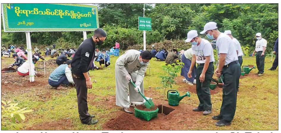
များကို ဌာနဆိုင်ရာတာဝန်ရှိသူ ခဲ့ကြသည်။ ယူကလစ်များဖြစ်ကြောင်း သိရများ၊ အသင်းအဖွဲ့များနှင့် ဒေသခံ ယနေ့စိုက်ပျိုးသည့် ပျိုးပင် ပြည်သူများက စိုက်ပျိုး များမှာ ခါတော်မီ၊ ပိတောက်၊ သည်။

နိုင်ငံအဝန်း စိမ်းလန်းစိုပြည်ရေးနှင့် သဘာဝပတ်ဝန်းကျင် တိုးတက်ကောင်းမွန်လာစေရေးကို အထောက်အကူပြုစေပြီး သဘာဝတောများမှ သယံဇာတ ထုတ်ယူသုံးစွဲမှု လျှော့ချနိုင်ရေး၊ ကျေးလက်ပြည်သူများ၏ အခြေခံစားဝတ်နေရေး လိုအပ်ချက်ကို ဖြည့်ဆည်းပေးနိုင်ရေးနှင့် ဒေသခံ ပြည်သူများ၏ လူမှုစီးပွားဘဝ ဖွံ့ဖြိုးတိုးတက်လာစေရန် ရည်ရွယ်၍ သစ်ပင်စိုက်ပျိုးပွဲကို ကျင်းပ