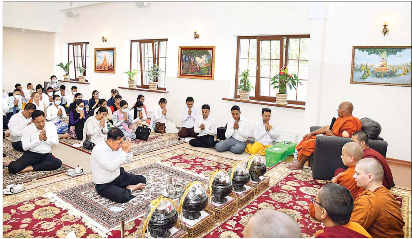
သဒ္ဓမ္မဇောတိက သိမ်တော်မြတ်အား ရေစက်သွန်းချ လှူဒါန်းခြင်းအခမ်းအနားတွင် နိုင်ငံတော်စီမံအုပ်ချုပ်ရေးကောင်စီဥက္ကဋ္ဌ၊ တပ်မတော်ကာကွယ်ရေးဦးစီးချုပ် ဗိုလ်ချုပ်မှူးကြီး မင်းအောင်လှိုင်နှင့် စည်ပရိသတ်များက ကျောင်းထိုင်ဆရာတော်ထံမှ ငါးပါးသီလ ခံယူဆောက်တည်ကြစဉ်။

အဆိုပါ မြန်မာထေရဝါဒဗုဒ္ဓဝိဟာရ(မော်စကို) သည် မော်စကိုမြို့လယ်၏ အရှေ့ဘက် ၁၄ ကီလို မီတာအကွာတွင် တည်ရှိပြီး သီတဂူကမ္ဘာ့ဗုဒ္ဓ တက္ကသိုလ်များ၏ အဓိပတိ အဘိဓဇ မဟာရဋ္ဌရူ၊ အဘိဓဇအဂ္ဂမဟာသဒ္ဓမ္မဇောတိက၊ မဟာဓမ္မ ကထိက ဗဟုဇနဟိတရေ၊ ရွှေကျင်နိကာယ ဥပဥက္ကဋ္ဌ တွဲဖက်ရွှေကျင်သာသနာပိုင် သီတဂူဆရာတော် ဘုရားကြီး ဒေါက်တာ ဘဒ္ဒန္တဉာဏိဿရ၏ မတည်မှု၊ မော်စကိုရောက် ကျောင်းသား၊ ကျောင်းသူများနှင့် မြန်မာ့တပ်မတော်မှ သင်တန်းသားအရာရှိများ၊ စေတနာရှင်အလှူရှင်များ၏ စုပေါင်းလှူဒါန်းမှုဖြင့် ၂၀၁၅ ခုနှစ်၊ ဇူလိုင် ၁ ရက်တွင် ဖွင့်လှစ်ခဲ့ခြင်းဖြစ် ကြောင်း၊ ဖွင့်ပွဲအခမ်းအနားသို့ သီတဂူဆရာတော် ဘုရားကြီးနှင့်အတူ ဥရောပ၊ အာရှနှင့် အမေရိကနိုင်ငံ များမှ ဆရာတော်များလည်း တက်ရောက်ခဲ့ကြ ကြောင်း၊ မြန်မာထေရဝါဒ ဗုဒ္ဓဝိဟာရ(မော်စကို) သို့မဟုတ် မြန်မာဘုန်းတော်ကြီးကျောင်းသည် ရုရှားနိုင်ငံရှိ ဗုဒ္ဓသာသနာပြုအဖွဲ့အတွက် အခြေပြု ရာ၊ ဘုရားဝတ်ပြုရာနေရာ၊ ဘာသာ သာသနာရေး ဆိုင်ရာ အခမ်းအနားများ ကျင်းပပြုလုပ်ရာ နေရာ တစ်ခုဖြစ်ကြောင်းနှင့် ကျောင်းထိုင်ဆရာတော် အနေဖြင့်လည်း ဗုဒ္ဓသာသနာရောင်ဝါ ထွန်းလင်း စေရေးအတွက် သာသနာရေးဆိုင်ရာလုပ်ငန်းများကို ကြိုးပမ်းဆောင်ရွက်လျက်ရှိကြောင်း သတင်းရရှိ သည်။ သတင်းစဉ်