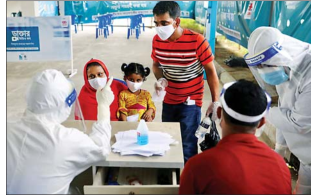
ဘင်္ဂလားဒေ့ရှ်နိုင်ငံ ဒါကာရှိ မက်ဒါဆေးဘက်ဆိုင်ရာ ကောလိပ်နှင့် ဆေးရုံ၌ ကိုဗစ်-၁၉ စမ်းသပ်မှုပြုခင် သက်ဆိုင်သူများက ဆရာဝန် နှင့်တိုင်ပင်နေသည်ကို တွေ့ရစဉ်။

နိုင်ငံအတွင်း ကိုဗစ်-၁၉ ကူးစက်ဖြစ်ပွားမှုမှ ပြန်လည် ကောင်းမွန်လာသူ ၇၈၅၄၈၂ ဦး အထိ ရောက်ရှိလာခဲ့သည်။ တရားဝင် သတင်းအချက်