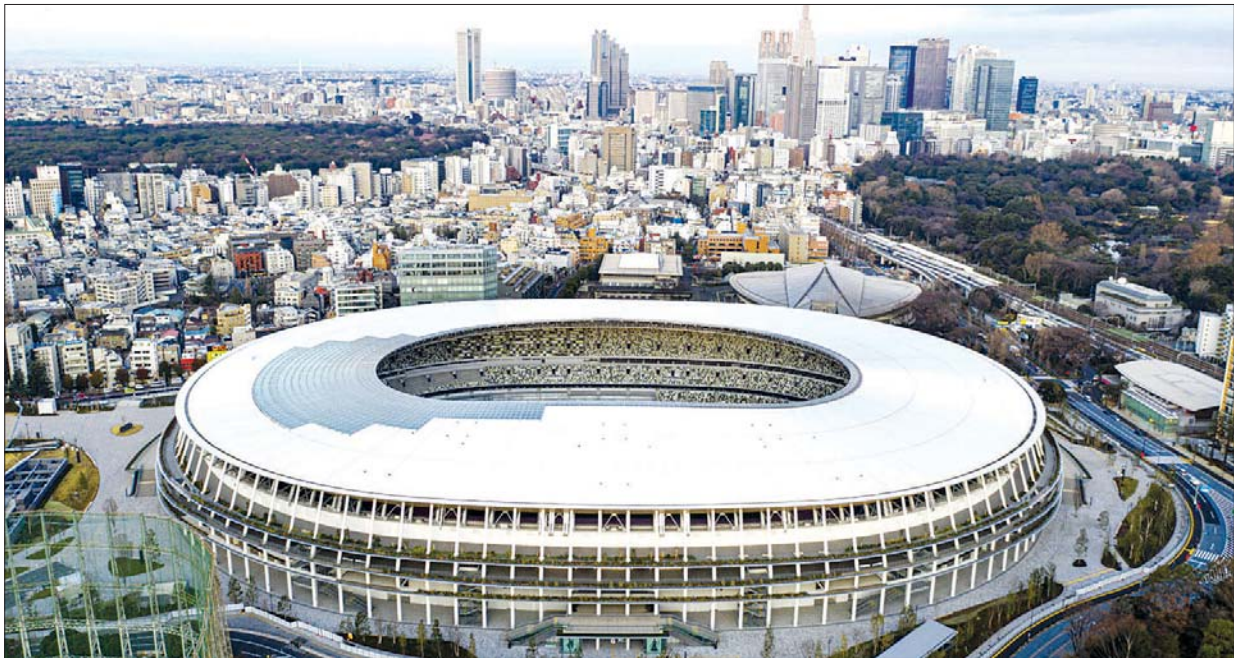
တိုကျိုအိုလံပစ် အားကစားရုံသစ်ကြီးကို တွေ့ရစဉ်။

ဂျပန်ဝန်ကြီးချုပ် ဆူဂါယိုရှိဟိဒဲနဲ့ အိုလံပစ်ပွဲစဉ်သူတွေက ထောက်ခံပြောနေသော်လည်း ၇၀ ရာခိုင်နှုန်းလောက်သော ပါဝင်ဖြေဆိုသူတွေကတော့ ဒီအားကစားပွဲတော်ကြီးကို ဘေးကင်းလုံခြုံစိတ်ချစွာ ကျင်းပနိုင်မှာ မဟုတ်ဘူးလို့ ဖြေကြားခဲ့ပါတယ်။