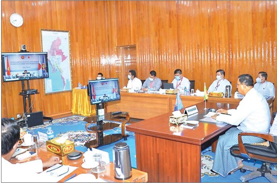
ဝန်ကြီးက အလှည့်ကျဥက္ကဋ္ဌအဖြစ် ဆောင်ရွက်သည်။ မူဝါဒချမှတ်ဆောင်ရွက် အစည်းအဝေးတွင် အာဆီယံနိုင်ငံများနှင့် ဂျပန် နိုင်ငံတို့မှ မိမိတို့ နိုင်ငံအလိုက် စွမ်းအင်ကဏ္ဍ များကို ဆွေးနွေးကြသည်။

အာဆီယံစွမ်းအင်ဆိုင်ရာဝန်ကြီးများနှင့် ဂျပန်နိုင်ငံ စီးပွားရေး၊ ကုန်သွယ်ရေးနှင့် စက်မှုဝန်ကြီးဌာန ဝန်ကြီးတို့အကြား စွမ်းအင်ကဏ္ဍဆိုင်ရာ ပူးပေါင်းဆောင်ရွက်မှုကိစ္စရပ်များနှင့် ပတ်သက်သည့် အထူးအစည်းအဝေး (The Special Meeting of ASEAN Ministers on Energy and Minister of Economy, Trade and Industry of Japan - SPECIAL AMEM-METI) ကို ယနေ့နံနက်ပိုင်းတွင် ဗီဒီယိုကွန်ဖရင့်စနစ်ဖြင့် ကျင်းပရာ လျှပ်စစ်နှင့် စွမ်းအင်ဝန်ကြီးဌာန ပြည်ထောင်စုဝန်ကြီး ဦးအောင် သန်းဦးနှင့် တာဝန်ရှိသူများ နေပြည်တော်မှ ပါဝင် တက်ရောက်သည်။ (ယာဝုံ)