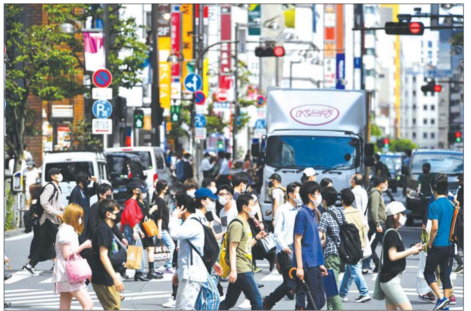
တိုကျိုမြို့တွင် သွားလာလှုပ်ရှားနေကြသူများကို တွေ့ရစဉ်။