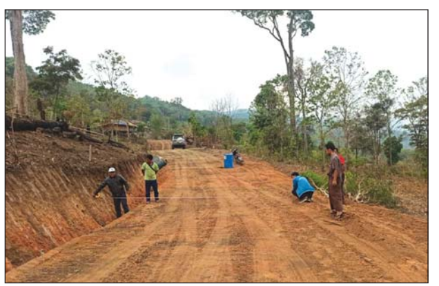
ကျေးလက်ကုန်ထုတ်လမ်းဖောက်လုပ်ပြီးစီးမှုကို တာဝန်ရှိသူများ ကြည့်ရှုစစ်ဆေးစဉ်။