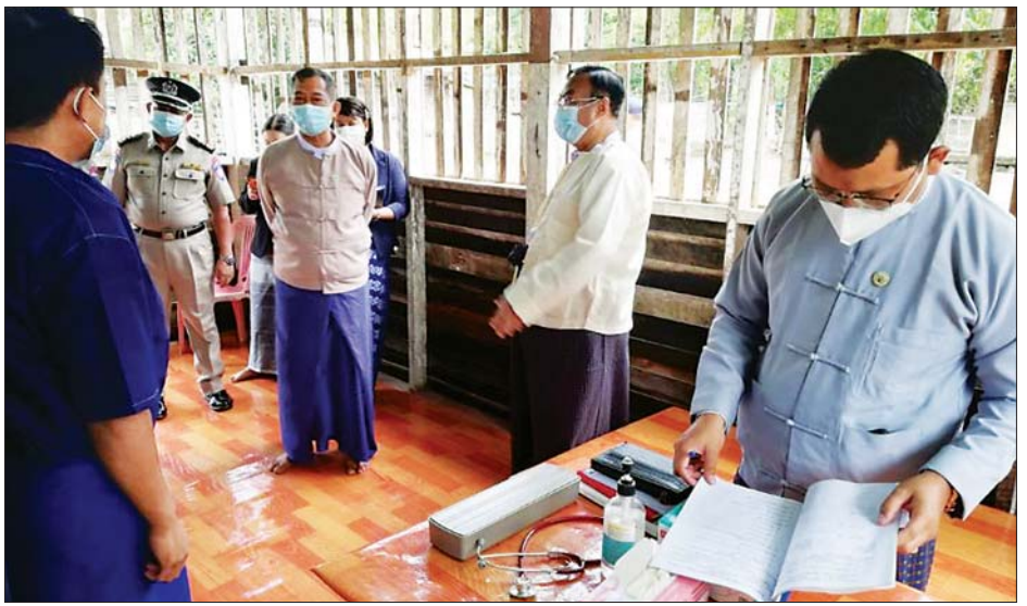
စစ်ဆေးတွေ့ရှိချက်နှင့် အကြံပြုချက်များကို လိုအပ် သက်ဆိုင်ရာသို့ ပေးပို့ဆောင်ရွက်သွားမည်ဖြစ် သလို အရေးယူ ဆောင်ရွက်ပေးနိုင်ရေးအတွက် ကြောင်း သိရသည်။ သတင်းစဉ်

အသုံးအဆောင်ပစ္စည်းများရရှိခြင်း ရှိ မရှိ၊ ကျန်းမာ ရေးစောင့်ရှောက်မှု ရှိ မရှိ၊ စိုက်ပျိုးမွေးမြူရေးနှင့် အသက်မွေးမှုအတတ်သင် စခန်းများအတွင်း ညည်းပန်းနီစက်မှု ရှိ မရှိနှင့် နေထိုင်စားသောက်မှု များကို မေးမြန်းမှတ်တမ်းတင်ခြင်းနှင့် တစ်ဦးချင်း တွေ့ဆုံလိုသူ အကျဉ်းသားများနှင့် တွေ့ဆုံကာ ၎င်းတို့၏ တင်ပြချက်များကို မှတ်တမ်းတင်ခဲ့ကြောင်း သိရသည်။ စိုက်ပျိုးမွေးမြူရေးနှင့် အသက်မွေးမှု အတတ် သင်စခန်းများကို ကြည့်ရှုစစ်ဆေးစဉ် အကျဉ်းသား များ၏ အိပ်ဆောင်များ၊ ဆေးပေးခန်းများ၊ စာကြည့်တိုက်၊ စားပိုကြီး၊ ရိက္ခာစတို၊ သောက်ရေနှင့် သုံးရေကန်များ၊ မိလ္လာများ သန့်ရှင်းမှု ရှိ မရှိ၊ လတ်တလောဖြစ်ပွားလျက်ရှိသော ကိုဗစ်- ၁၉ ရောဂါကာကွယ်ရေးနှင့်စပ်လျဉ်း၍ ဆောင်ရွက်ထားရှိ မှုများကို ကြည့်ရှုစစ်ဆေးခဲ့ပြီး ခရီးစဉ်အတွင်း