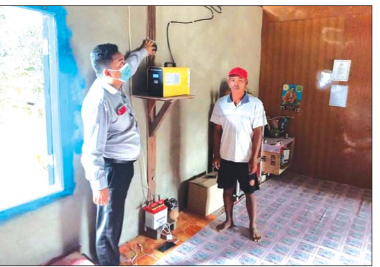
တစ်အိမ်သုံးဆီလီယံစနစ်ဖြင့် မီးရရှိရေး ဆောင်ရွက်စဉ်။ များကိုမူ စီမံကိန်းရန်ပုံငွေမှ ရာနှုန်းပြည့် ဒေသဖွံ့ဖြိုးတိုးတက်ရေး ဦးစီးဌာနမှူး အခမဲ့ထောက်ပံ့၍ ဆိုလာများ တပ်ဆင် ဦးဆောင်ကျော်ဟိန်းထံမှ သိရသည်။ ပေးခဲ့ကြောင်း လွိုင်လင်မြို့နယ် ကျေးလက် ငြိမ်းသူ

ပေးခဲ့ရာ ယခု ဇွန်လထဲတွင် ဆိုလာများ အားလုံးရာနှုန်းပြည့် တပ်ဆင်ဆောင်ရွက်ပြီးစီးသွားခြင်းဖြစ်သည်။ တစ်အိမ်သုံးဆီလီယံစနစ်ကို ဒေသခံပြည်သူများက မိမိပိုင်ပစ္စည်းကဲ့သို့ စနစ်တကျ ကိုင်တွယ်အသုံးပြုစေရန် ရည်ရွယ်လျက် ဝပ် ၆၀ ဆိုလာစနစ်အတွက် တစ်စုံလျှင် ကျပ် ၁၅၀၀၀၀ ဆိုလာစနစ်အတွက် တစ်စုံလျှင် ကျပ် ၁၅၀၀၀၀ ပြည်သူများက အချိုးကျ အရစ်ကျစနစ်ဖြင့် နှစ်ကြိမ်ခွဲ၍ ထည့်ဝင်ရပြီး ဆိုလာစနစ် တစ်စုံစာအတွက် ကျန်ရှိသည့် တန်ဖိုးကို စီမံကိန်းရန်ပုံငွေမှ ကျခံပေးသည်။ စီမံကိန်းကျေးရွာများရှိ အများပြည်သူဆိုင်ရာ အဆောက်အအုံများဖြစ်သည့် စာသင်ကျောင်း၊ ဆေးပေးခန်း၊ ဘာသာရေးကျောင်းများနှင့် လမ်းမီးတိုင်