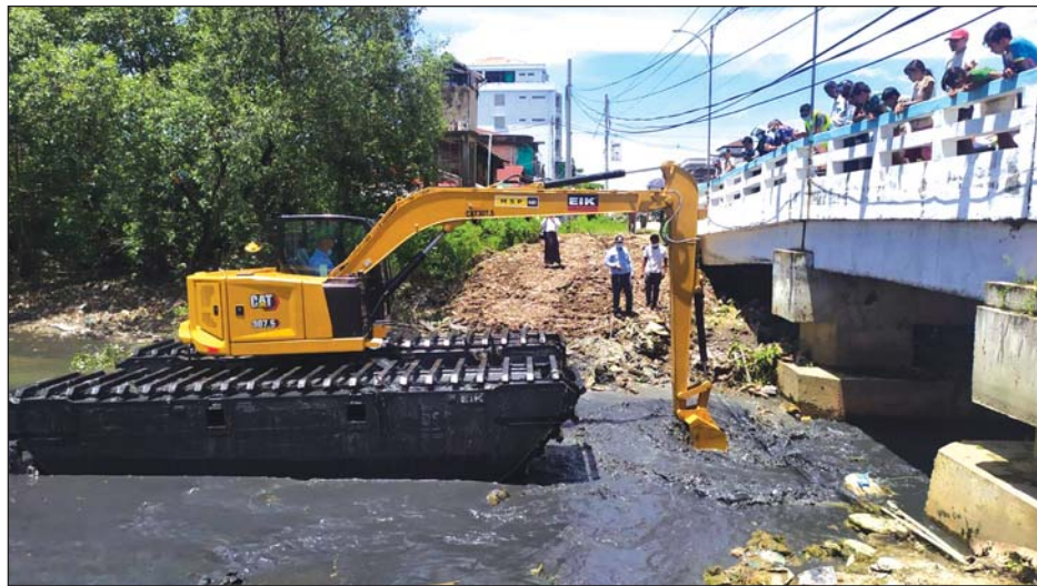
တိမ်ကောနေသောချောင်းကို ကုန်း/ရေနှစ်တန်သွား ဘက်ဟိုးယာဉ်ဖြင့် ပြန်လည်ဆယ်ယူစဉ်။

ကုန်း/ရေနှစ်တန်သွား ဘက်ဟိုး(မြေတူးယာဉ်) သည် CAT 307.5 AM 80 အမျိုးအစားဖြစ်ပြီး ယာဉ်အကျယ်သည် ၁၁ ပေ ၁ လက်မရှိကာ ၁၃ ပေ ၉ လက်မအထိ ချဲ့ကားနိုင်ကြောင်း၊ ထို့အတူ ယာဉ်တွင် ရေလုံ ဗောဇဏ်ဖက် မတပ်ဆင်ဘဲ ရေအနက် ၁ ဒသမ ၁ မီတာဆင်း၍ တူးဖော်နိုင်ပြီး ယာဉ်တွင် ရေလုံဗော