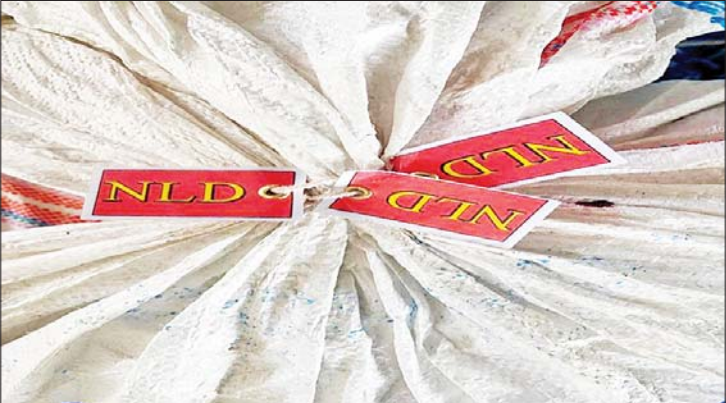
NLD တံဆိပ်များဖြင့် ချိပ်ပိတ်ထားသည့်မဲလက်မှတ်အိတ် မှတ်တမ်းဓာတ်ပုံ။

အထက်မှာဖော်ပြထားသလို ရုပ်/ ကျေး ဥက္ကဋ္ဌတွေနဲ့ ရွေးကော်အဖွဲ့ခွဲ အဖွဲ့ဝင်တွေက NLD အမာခံတွေဖြစ်နေ လေတော့ ကြိုတင်မဲကောက်ယူရာမှာ နည်းလမ်းမျိုးစုံနဲ့ ညစ်ခဲ့ကြပါတော့ တယ်။ ကြိုတင်မဲပေးရတဲ့ သက်ကြီး ရွယ်အိုတွေအားလုံးနီးပါးသည် အမြင် အာရုံချို့တဲ့နေကြပြီဖြစ်ပါတယ်။ ဒါကို အခွင့်ကောင်းယူပြီး NLD ကိုယ်စားလှယ် နေရာမှာ အမှန်ခြစ်ဖို့၊ တံဆိပ်တုံးထုစေဖို့ နည်းလမ်းမျိုးစုံနဲ့ ဆောင်ရွက်တဲ့ကိစ္စတွေ ဖြစ်ခဲ့ကြတော့တာပေါ့။ ပါတီအလံတွေ၊ တံဆိပ်တွေနဲ့ ကြိုတင်မဲ လာကောက်ကြ တဲ့နေရာတွေမှာ ပြည့်သူ့အများစုက NLD ပါတီအတွက် မဲတွေလာကောက်တယ် လို့ပဲ ထင်မြင်ယူဆနေကြပါတော့တယ်။