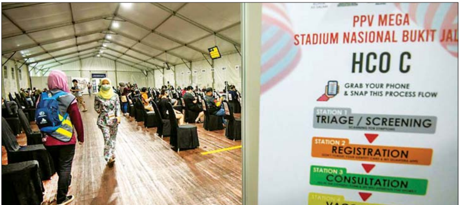
ကိုဗစ်-၁၉ ကာကွယ်ဆေးထိုးခံပြီးနောက် နာရီဝက်ခန့် အခြေအနေစောင့်ကြည့်နေသူများကို တွေ့ရစဉ်။