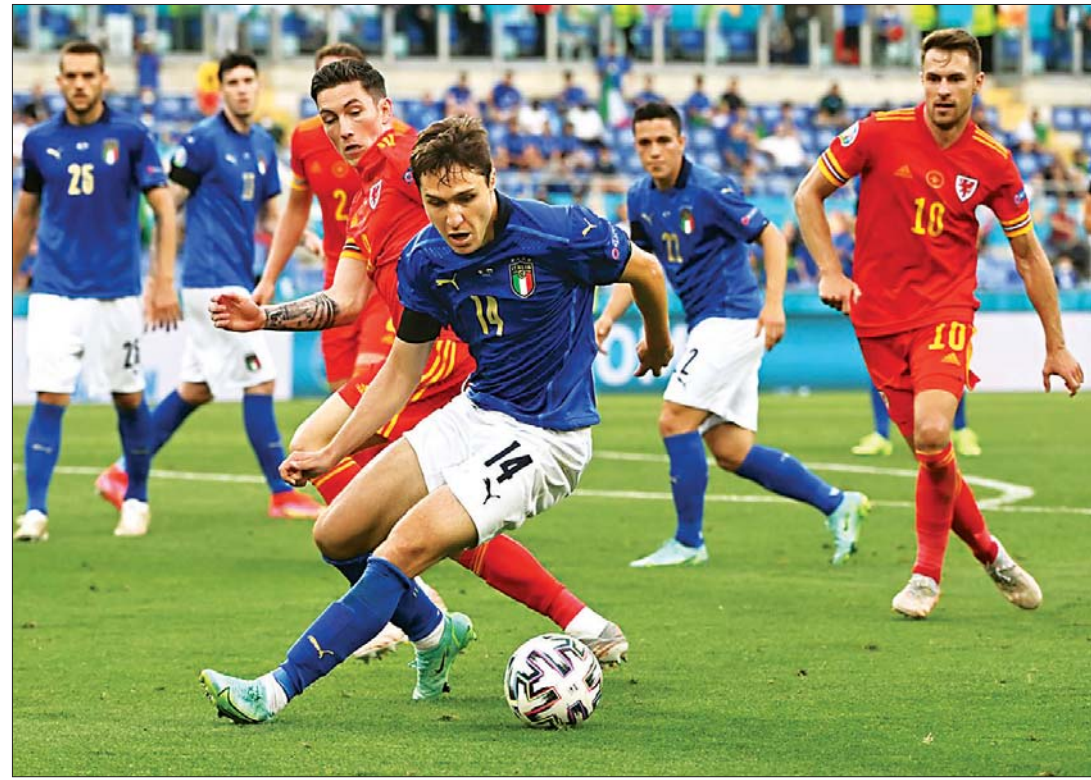
အီတလီအသင်းမှ ကစားသမား ဝေးလ်အသင်းဘက်သို့ ထိုးဖောက်ကစားစဉ်။

ယူရို ၂၀၂၀ ချန်ပီယံရှစ်ပြိုင်ပွဲ ပွဲစဉ် (၃) အဖြစ် အုပ်စု (A) မှ ဆွစ်ဇာလန်နှင့် တူရကီ၊ အီတလီနှင့် ဝေးလ်အသင်းတို့ပွဲစဉ်ကို ယမန်နေ့ညပိုင်းက တစ်ပြိုင်တည်း ယူရိုပြိုင်ပွဲနောက်တစ်ဆင့် ဆွစ်ဇာလန်နှင့် တူရကီအသင်းတို့ ပွဲစဉ်တွင် ဆွစ်ဇာလန်အသင်းက သုံးဂိုး-တစ်ဂိုးဖြင့် အနိုင်ရရှိပြီး အီတလီနှင့် ဝေးလ်အသင်းတို့ ပွဲစဉ်တွင် အီတလီအသင်းက တစ်ဂိုး-ဂိုးမရှိဖြင့် အနိုင်ရရှိခဲ့သည်။ ဆွစ်ဇာလန် အသင်းသည် ယနေ့ပွဲစဉ်တွင် တူရကီအသင်းကို သုံးဂိုး-တစ်ဂိုးဖြင့် အနိုင်ရရှိခဲ့သောကြောင့် ဝေးလ်အသင်းနှင့် ရမှတ်တူ ဂိုးကွာခြားချက်ဖြင့် အုပ်စုတတိယနေရာတွင် ရပ်တည်နေပြီး အကောင်းဆုံးအုပ်စု တတိယဖြင့် နောက်တစ်ဆင့် စာမျက်နှာ ၉ ကော်လံ ၄ □