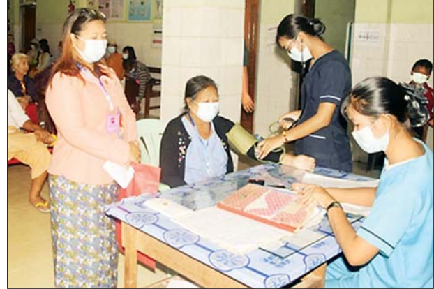
ပြင်ဦးလွင်တပ်မတော်ဆေးရုံ၌ ပြည်သူများအား ကုသပေးစဉ်။

နေပြည်တော် ဇွန် ၂၁ ပြည်သူ့လူထုအတွက် အဓိကအကျဆုံးဖြစ်သော ကျန်းမာရေးကဏ္ဍ မြင့်မားရေးအတွက် တပ်မတော်မှ ပါရဂူများ၊ ဆေးမှူးများ၊ သူနာပြုများဖြင့် ဝိုင်းဝန်းကူညီဆောင်ရွက်ပေးလျက်ရှိသည့်အပြင် ပြည်သူ့လူထု၏ အရေးပေါ်ကျန်းမာရေးဆိုင်ရာကုသမှုများ ဆောင်ရွက်ပေးနိုင်ရန်အတွက် တပ်မတော်ဆေးရုံများနှင့် ယာယီကုသရေးဆေးရုံများ၌ ကျန်းမာရေးစောင့်ရှောက်မှုများကို နေ့ညမပြတ်