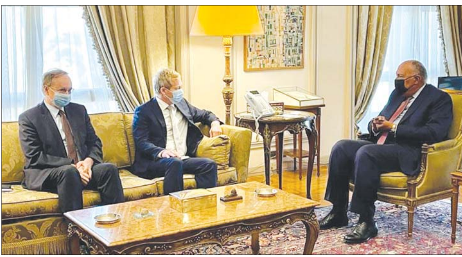
အီဂျစ်နိုင်ငံခြားရေးဝန်ကြီး ဆမက်ရှီ ဂျီခရီ နှင့် အရှေ့အလယ်ပိုင်း ငြိမ်းချမ်းရေးဆိုင်ရာ ဥရောပသမဂ္ဂ အထူးကိုယ်စားလှယ် ဆဗန်ဇုပန်တို့ ဇူလိုင် ၂၀ ရက်က တွေ့ဆုံကြစဉ်။

၁၉၆၇ခုနှစ် နယ်စပ်သတ်မှတ် ချက်အတိုင်း လွတ်လပ်သော ပါလက်စတိုင်းအဖြစ် တည်ထောင် နိုင်ရေး စေ့စပ်ညှိနှိုင်းမှုများ ပြုလုပ်နိုင်ရေး အီဂျစ်ထိပ်တန်း သံတမန်က တောင်းဆိုခဲ့ခြင်းဖြစ် သည်။ အရှေ့အလယ်ပိုင်းငြိမ်းချမ်း ရေးဖြစ်စဉ် ဆက်လက် ရှေ့ဆက် နိုင်ရေးအတွက် ဥရောပသမဂ္ဂ