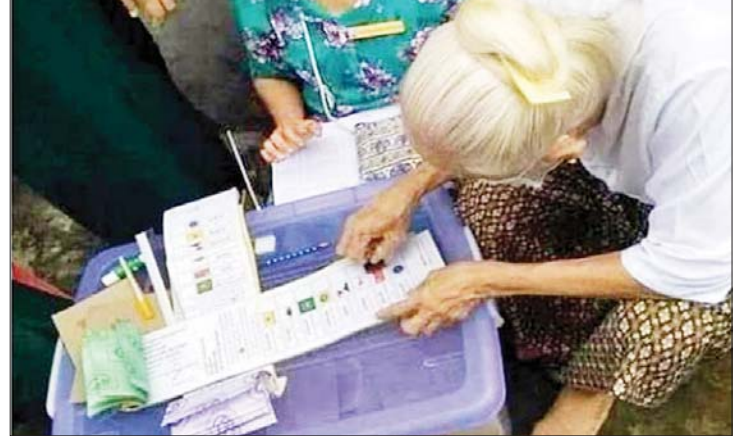
ဥပဒေနှင့်အညီ ဆောင်ရွက်ခြင်းမရှိသည့် ကြိုတင်ဆန္ဒမဲများ ကောက်ယူနေသည့်ပုံများ။

နိဂုံးချုပ်အနေနဲ့ အကြံပြုလိုတာက ၂၀၂၀ ပြည့်နှစ်ရွေးကောက်ပွဲမှာ ဖြစ်ခဲ့တဲ့ ဥပဒေချိုးဖောက်မှုတွေနဲ့ မဲလိမ်မဲခိုးမှု တွေသည် အသေအချာ စနစ်တကျနဲ့ တစ်ဆင့်ချင်း မှတ်တမ်းရုပ်ရှင်တွေရိုက် ပြီး ပြည်သူကို ချပြရမယ့်ကိစ္စရပ်တွေဖြစ် ပါတယ်။ ဒီလိုဖော်ပြတဲ့နေရာမှာလည်း သာမန်ပြည်သူလူထုကြီး နားလည် သဘောပေါက်နိုင်တဲ့ပုံစံနဲ့ အဆင့်ဆင့် ချိတ်ဆက်သုံးသပ်တင်ပြဖို့က အင်မတန် မှအရေးကြီးလှပါတယ်။ ၎င်းအချက်အလက် များနဲ့ မှတ်တမ်းရုပ်ရှင်များသည် မြန်မာ့ သမိုင်းမှာ မှတ်ကျောက်ဖြစ်လာမည့် သင်ခန်းစာယူစရာများဖြင့် ပြည့်နှက်နေ မည့် အချက်အလက်အထောက်အထား များ ဖြစ်လာလိမ့်မည်ဟု တင်ပြရင်း စာရေးသူရဲ့ ဆောင်းပါးကို နိဂုံးချုပ် လိုက် ရပါတယ်။ ရွှင်လန်းချမ်းမြေ့ ကြပါစေ။ ။