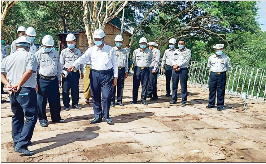
ပြည်ထောင်စုဝန်ကြီး ဦးရွှေလေး ပန်းဆေးချောင်းတံတား တည်ဆောက်ရေးလုပ်ငန်းများ ကြည့်ရှုစစ်ဆေးစဉ်။

နေပြည်တော် ဇွန် ၂၁ ဆောက်လုပ်ရေးဝန်ကြီးဌာန ပြည်ထောင်စုဝန်ကြီး ဦးရွှေလေးသည် ယနေ့ နံနက်ပိုင်းတွင် မန္တလေးတိုင်းဒေသကြီး ကျောက်ဆည်ခရိုင် တံတားဦးမြို့နယ်တွင် တံတားဦးစီးဌာန၊ တံတားအထူးအဖွဲ့(၄)မှ တာဝန်ယူ တည်ဆောက်နေသော အရှည် ပေ ၃၀၀ ပန်းဆေးချောင်းတံတား တည်ဆောက်ရေးလုပ်ငန်းများ ဆောင်ရွက်နေမှုအခြေအနေကို ကြည့်ရှုစစ်ဆေးရာ ပြည်ထောင်စုဝန်ကြီးက လုပ်ငန်းများ အရည်အသွေးပြည့်မီရေး အထူးအလေးထား ဆောင်ရွက်ရန် ယခင်တံတားဟောင်းကို စနစ်တကျ ဖြိုတိုက်သိမ်းပြီး တိုင်းဒေသကြီးအတွင်းရှိ ကျေးလက်လမ်းပေါ်ရှိ တံတားအဖြစ် အကျိုးရှိစွာ ပြန်လည်အသုံးပြုနိုင်ရေး စီစဉ်ဆောင်ရွက်ရန်တို့ကို မှာကြားကာ Over Lay Slab လုပ်ငန်းများ ဆောင်ရွက်ပြီးစီးမှု၊ ကျန်ရှိသည့် Girder လုပ်ငန်းများ ဆောင်ရွက်နေမှုတို့ကို ကြည့်ရှုစစ်ဆေးသည်။ ထို့နောက် ပြည်ထောင်စုဝန်ကြီးနှင့် အဖွဲ့သည်