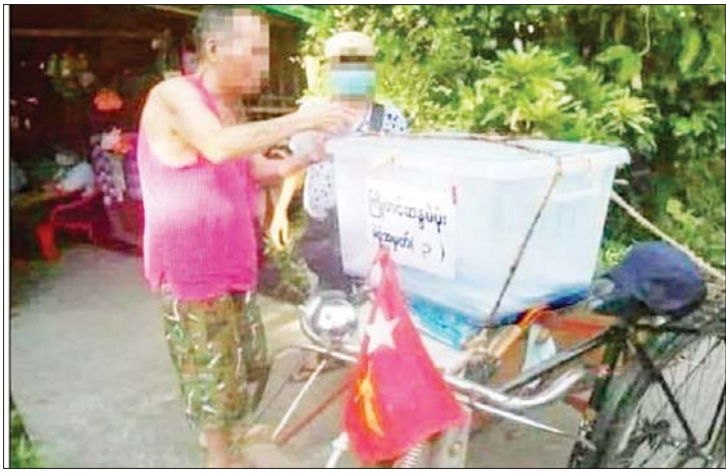
ဥပဒေနှင့်အညီ ဆောင်ရွက်ခြင်းမရှိသည့် ကြိုတင်ဆန္ဒမဲများ ကောက်ယူနေသည့်ပုံများ။