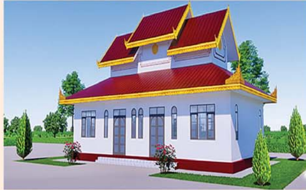
ဂေါပကနံ (၄၈x၂၄)ပေ ၁ လုံး-၄၂၃ သိန်း