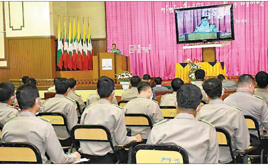
ပြည်ထောင်စုဝန်ကြီး ဒုတိယဗိုလ်ချုပ်ကြီး စိုးထွဋ် ပြင်ဦးလွင်မြို့နယ် (ဇီးပင်ကြီး) ရှိ ဗဟိုဝန်ထမ်းတက္ကသိုလ် (အထက်မြန်မာပြည်)တွင် ဖွင့်လှစ်သည့် အထွေထွေအုပ်ချုပ်ရေးဦးစီးဌာနမှ အုပ်ချုပ်မှု စွမ်းရည်မြှင့်တင်ရေးသင်တန်းအမှတ်စဉ် (၁)သို့ တက်ရောက်လျက်ရှိသည့် သင်တန်းသား သင်တန်းသူများကို တွေ့ဆုံမှာကြားစဉ်။

နေပြည်တော် ဇွန် ၂၁ နိုင်ငံတော်စီမံအုပ်ချုပ်ရေးကောင်စီအဖွဲ့ဝင်၊ ပြည်ထောင်စုဝန်ကြီးဌာန ပြည်ထောင်စုဝန်ကြီး ဒုတိယဗိုလ်ချုပ်ကြီး စိုးထွဋ်သည် ယနေ့ နံနက်ပိုင်းတွင် ပြင်ဦးလွင်မြို့နယ် (ဇီးပင်ကြီး) ရှိ ဗဟိုဝန်ထမ်းတက္ကသိုလ်(အထက်မြန်မာပြည်)တွင် ဖွင့်လှစ်သည့် အထွေထွေအုပ်ချုပ်ရေးဦးစီးဌာနမှ အုပ်ချုပ်မှု စွမ်းရည်မြှင့်တင်ရေးသင်တန်း အမှတ်စဉ် (၁) သို့ တက်ရောက်လျက်ရှိသည့် သင်တန်းသား သင်တန်းသူများကို တွေ့ဆုံသည်။