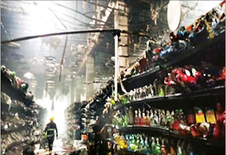
မင်္ဂလာတောင်ညွန့်မြို့နယ်ရှိ “1 STOP SUPER MARKET” ဆိုင်အား အကြမ်းဖက်သူများက မီးရှို့ဖျက်ဆီးထားမှုကို တွေ့ရစဉ်။

ရသဖြင့် သက်မဲ့ပြုလုပ် ရှင်းလင်းခဲ့ကြောင်း သိရသည်။ ဝိုင်းဝန်းမီးငြိမ်းသတ်ခဲ့ ထို့အတူ နံနက် ၃ နာရီခွဲတွင်ပင် မင်္ဂလာတောင်ညွန့်မြို့နယ် ကူးတို့ဆိပ်ရပ်ကွက် အထက်ပုဇွန်တောင်လမ်း အမှတ် (၅၇၆/၆၁) တွင် ဖွင့်လှစ်ထားရှိသည့် “1 STOP SUPER MARKET” ဌာနလည်းကောင်း၊ နံနက် ၃ နာရီ ၄၅ မိနစ်တွင် ကျောက်တံတားမြို့နယ် အမှတ်(၇)ရပ်ကွက် ဗိုလ်ချုပ်လမ်းနှင့် ၃၉ လမ်းထောင့်၊ အမှတ်(၂၅၉/၂၆၁) တွင် ဖွင့်လှစ်ထားသည့် “1 STOP SUPER MARKET” တွင် လည်းကောင်း မီးလောင်မှုများ ဖြစ်ပွားခဲ့သဖြင့် လုံခြုံရေး တပ်ဖွဲ့ဝင်များနှင့် မီးသတ်တပ်ဖွဲ့ဝင်များ ပူးပေါင်း၍ ဝိုင်းဝန်းမီးငြိမ်းသတ်ခဲ့ကြသည်။ မီးလောင်မှု ဖြစ်စဉ်များကြောင့် ပရိဘောဂပစ္စည်းအချို့နှင့် လူသုံးကုန်ပစ္စည်းအချို့ မီးလောင်ဆုံးရှုံးခဲ့ပြီး မီးရှို့ဖျက်ဆီးခဲ့သည့် အကြမ်းဖက်သူများကို ဖော်ထုတ်ဖမ်းဆီး၍ ဥပဒေနှင့်အညီ အရေးယူနိုင်ရေး လုံခြုံရေးတပ်ဖွဲ့ဝင်များက လိုအပ်သော စစ်ဆေးမှုများ ဆောင်ရွက်လျက် ရှိကြောင်း သတင်းရရှိသည်။ သတင်းစဉ်