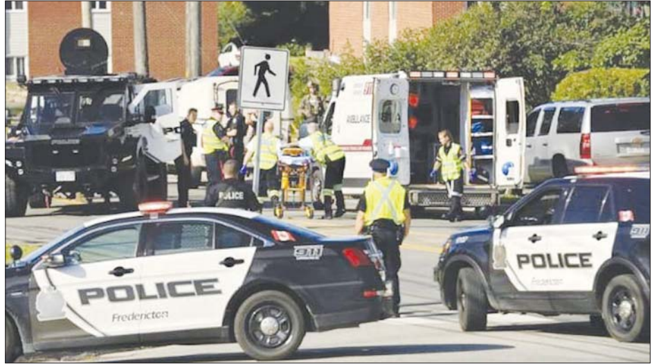
ပစ်ခတ်မှုဖြစ်ပွားရာနေရာတွင် စုံစမ်းစစ်ဆေးမှုပြုလုပ်နေကြသည့်ရဲများကို တွေ့ရစဉ်။