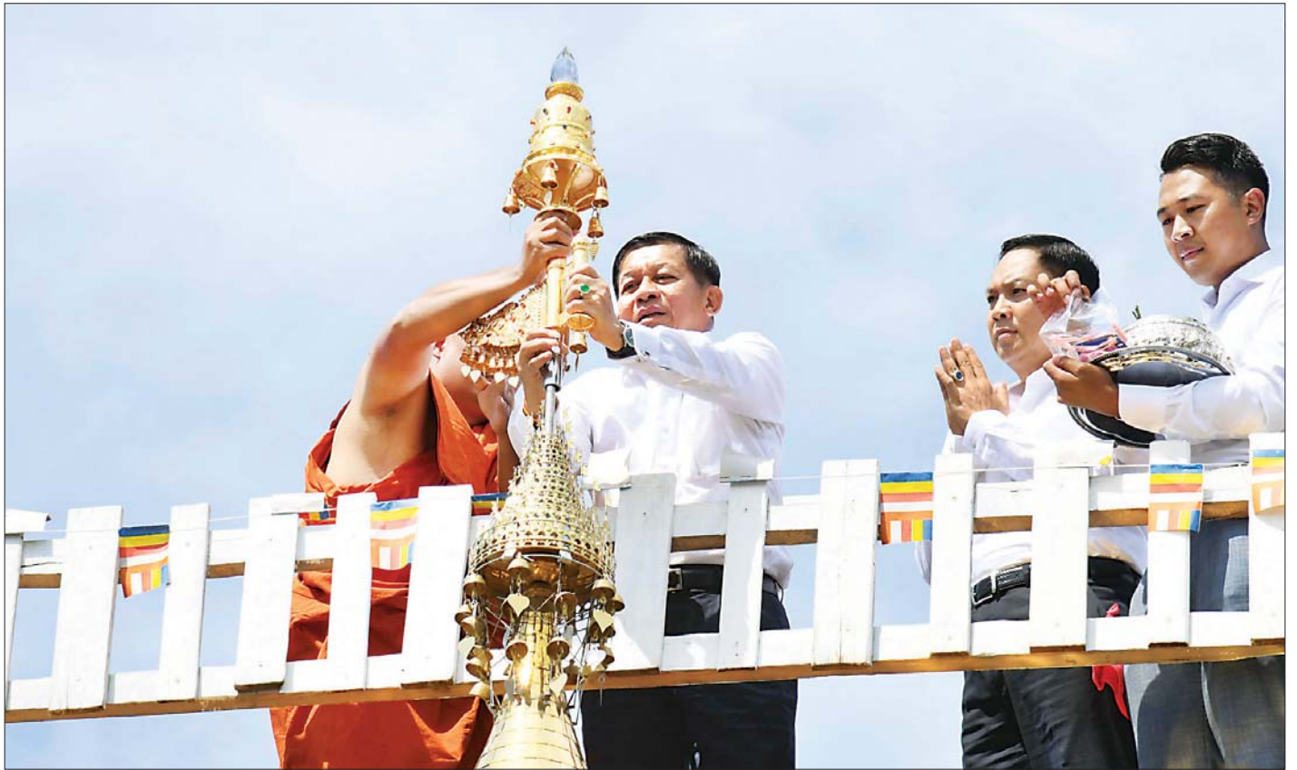
နိုင်ငံတော်စီမံအုပ်ချုပ်ရေးကောင်စီဥက္ကဋ္ဌ၊ တပ်မတော်ကာကွယ်ရေးဦးစီးချုပ် ဗိုလ်ချုပ်မှူးကြီး မင်းအောင်လှိုင် ရတနာစိန်ဖူးတော်အား ရွှေတိဂုံစေတီတော် ပုံတူတော်မြတ်အထွတ်သို့ ပင့်ဆောင်တင်လှူပူဇော်စဉ်။

ယင်းနောက် ရွှေတိဂုံစေတီတော်ပုံတူတော် မြတ်အား ဗုဒ္ဓါဘိသေက အနေကဇာတင်မင်္ဂလာအား ဆက်လက်ပြုလုပ်ပြီး တပ်မတော်အကြီးအကဲများ၊