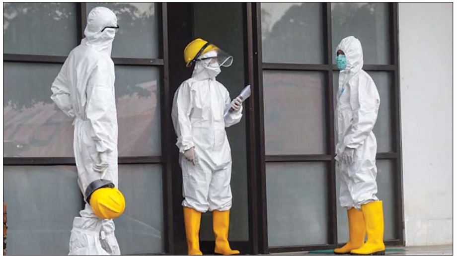
ရောဂါလက္ခဏာမပြသည့် ကိုဗစ်-၁၉ ကူးစက်ဖြစ်ပွားသူများကို လူနာတင်ယာဉ်ဖြင့် ဆေးရုံသို့ ရွှေ့ပြောင်းရန် ဆေးဘက်ဆိုင်ရာ အလုပ်သမားများ ပြင်ဆင်နေစဉ်။

ကမ္ဘာပေါ်တွင် စတုတ္ထမြောက်လူဦးရေအများ ဆုံးနိုင်ငံဖြစ်သည့် အင်ဒိုနီးရှားနိုင်ငံတွင် ဇန်နဝါရီ လလယ်၌ ကိုဗစ်-၁၉ ကာကွယ်ဆေးထိုးနှံမှု စတင် ခဲ့သည်။ ဆင်ဟွာ