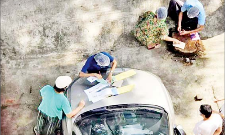
ဥပဒေနှင့်အညီ ဆောင်ရွက်ခြင်းမရှိသည့် ကြိုတင်ဆန္ဒမဲများ ကောက်ယူနေသည့်ပုံများ။

ဒီလိုဥပဒေချိုးဖောက်မှုနဲ့ ရလာတဲ့ မဲလက်မှတ်တွေအားလုံးကို ဘောင်ဝင် အောင် ဆောင်ရွက်ဖို့ UEC တံဆိပ်မပါ သည့် အမှန်ခြစ်၊ ဘောပင်ဖြင့်ခြစ်ထား သည့်အမှန်ခြစ် စတဲ့မဲလက်မှတ်တွေကို ခိုင်လုံမဲတွေဖြစ်လာဖို့ ညွှန်ကြားချက်တွေ ထုတ်ပြန်ထားခဲ့ပါတယ်။ အကြောင်းပြ ချက်ကတော့ တံဆိပ်တုံးအထွက် တယ်လို့ဆိုခဲ့တာပေါ့။ COVID-19 ကြောင့် ရောက်ရာအရပ်ကနေ ကြိုတင်မဲပေးထား