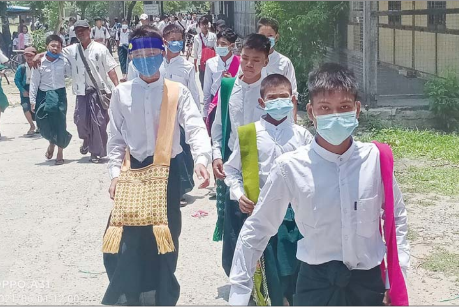
အ ထ က- ၁ ရမည်းသင်း ကျောင်းသားများ ကျောင်းဆင်းအပြန်မြင်ကွင်းကို တွေ့ရစဉ်။ ပညာသင်ကြားရန် ကျောင်းအပ်လက်ခံထားသော ကျောင်းသား ငါးသောင်းကျော် ရှိပြီဖြစ်သည်။ ယခုနှစ်တွင် ခရိုင်တစ်ခုလုံးအတွင်း လက်ရှိပညာ သင်ကြားနေသော ကျောင်းသား ကျောင်းသူများမှာ ရာခိုင်နှုန်းအားဖြင့် ၆၄ ဒသမ ၄ ရာခိုင်နှုန်း လာရောက် ပညာသင်ကြားလျက်ရှိသည်။ မောင်စိန်လွင်(မြန်မာ့အလင်း)

ကျောင်း စုစုပေါင်း ၄၇၆ ကျောင်းကို ဇွန် ၁ ရက်တွင် စတင်ဖွင့်လှစ်သင်ကြားကြောင်း သိရသည်။ “တကယ်တော့ ကျောင်းတွေဖွင့်တာနဲ့ အခြား အကြောင်းအရာတွေ မရောယှက်စေချင်ဘူး။ ဒါက ကျွန်မအမြင်ပါ။ အဲဒီလို ရောယှက်သွားရင် တကယ် နှစ်နာတာက ကျောင်းသားမိဘတွေနဲ့ ကျောင်းသား တွေကိုယ်တိုင်ပဲ။ ကိုဗစ်-၁၉ ရောဂါ ကြောင့်လည်း ပညာသင်နှစ် တစ်နှစ်နစ်နာခဲ့ရပြီးပြီ။ ကလေးတွေကို နောက်ထပ် ပညာသင်နှစ် ထပ်ပြီးမဆုံးရှုံးစေချင်တော့ ဘူး။ အေးအေးချမ်းချမ်းနဲ့ပဲ ဒီပညာသင်နှစ်ကို ဖြတ်သန်းစေချင်တယ်” ဟု ရမည်းသင်းမြို့ အထက(၁)မှ အလယ်တန်းပြ ဆရာမတစ်ဦးက ပြောသည်။ ရမည်းသင်းခရိုင်အတွင်း အခြေခံပညာကျောင်း များတွင် ပညာသင်ကြားလျက်ရှိသော ကျောင်းသား စုစုပေါင်း ရှစ်သောင်းကျော်ရှိပြီး လက်ရှိတွင်