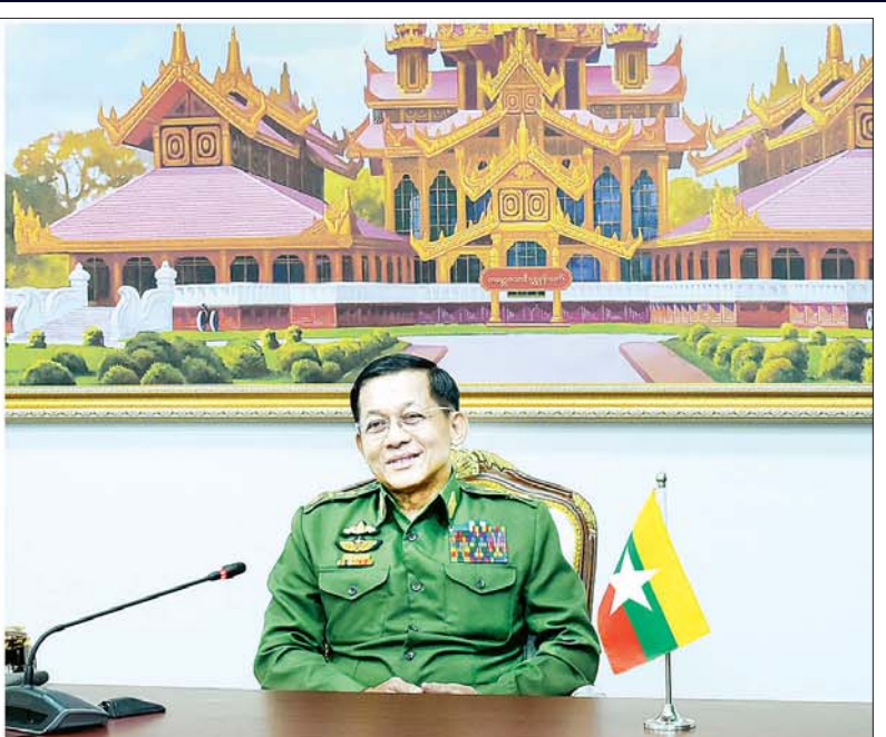
နိုင်ငံတော်စီမံအုပ်ချုပ်ရေးကောင်စီဥက္ကဋ္ဌ၊ တပ်မတော်ကာကွယ်ရေးဦးစီးချုပ် ဗိုလ်ချုပ်မှူးကြီး မင်းအောင်လှိုင် တရုတ်ပြည်သူ့သမ္မတနိုင်ငံ Phoenix ရုပ်သံမီဒီယာ၏ သိရှိလိုသည့် မေးမြန်းမှုများကို လက်ခံဖြေကြားစဉ်။