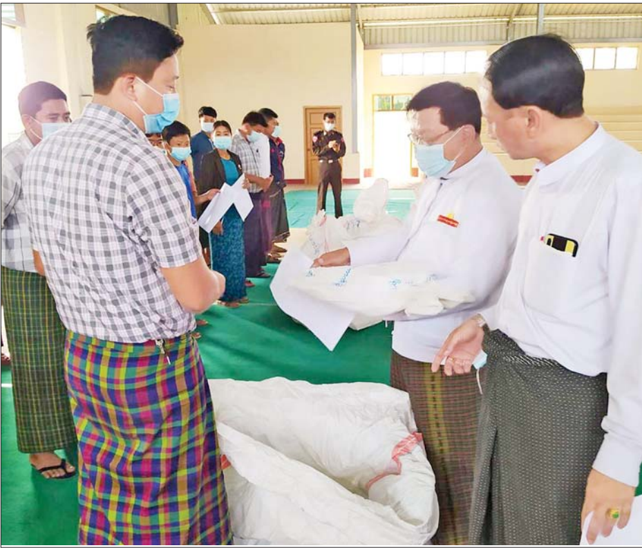
ဝိုင်းမော်မြို့နယ် ဆန္ဒမဲလက်မှတ်မြေပြင်စစ်ဆေးမှု မှတ်တမ်းဓာတ်ပုံ။