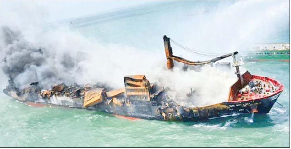
လောင်ကျွမ်းပေါက်ကွဲခဲ့သော ကုန်တင်သင်္ဘောကို တွေ့ရစဉ်။

သင်္ဘောဆယ်ယူခြင်း လုပ်ငန်း များကို ရာသီဥတုဆိုးရွားမှုကြောင့် ခေတ္တရပ်နားခဲ့ရသည်။ အဆိုပါ ကုန်တင်သင်္ဘော သည် လောင်စာဆီ ၃၂၀ တန် တင်ဆောင်ခဲ့ပြီး လောင်စာဆီများ က မီးလောင်မှုကို ဖြစ်စေခဲ့သည် လားဆိုပြီး စုံစမ်းစစ်ဆေးမှုများ ကို ဆောင်ရွက်လျက်ရှိကြောင်း သိရသည်။ အဆိုပါ ကုန်တင်သင်္ဘော သည် စင်ကာပူအလံလွှင့်ထူထား ပြီး ကုန်သေတ္တာပေါင်း ၁၄၈၆ လုံး၊ နိုက်ထရစ်အက်စစ် ၂၅ တန်နှင့် အခြား ဓာတုပစ္စည်းများနှင့် အလှ ကုန်ပစ္စည်းများကို တင်ဆောင် ခဲ့ပြီး မေ ၁၅ ရက်တွင် အိန္ဒိယနိုင်ငံ ဟာဇီရာဆိပ်ကမ်းမှ ထွက်ခွာခဲ့ သည်။ ဆင်ယွာ