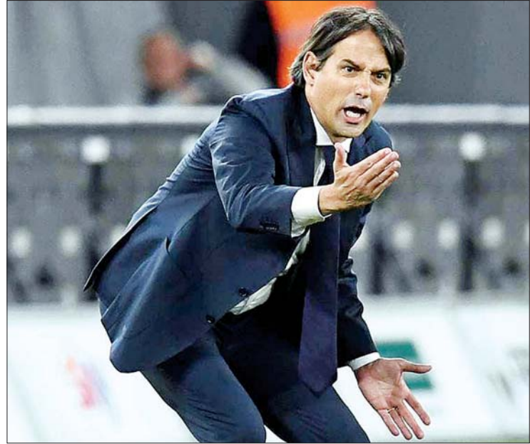
နည်းပြ ဆီမြွန်နီ အင်ဇာဂီ

အီတလီစီးရီးအေချန်ပီယံ အင်တာမီလန် အသင်းသည် ပြီးခဲ့သည့် သီတင်းပတ်တွင် အသင်းမှ ထွက်ခွာသွားသော နည်းပြ အင်ဇာဂီ ဖြင့် အစားထိုးခန့်အပ်လိုက် ဖြစ်ကြောင်း သတင်းများတွင် ဖော်ပြ