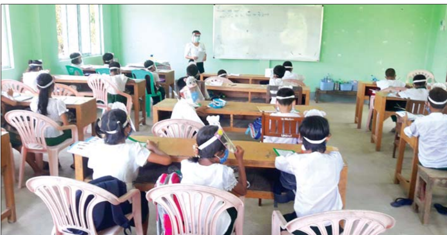
ထန်းတပင်မြို့နယ်၌ ကျောင်းသား ကျောင်းသူများ ပညာသင်ကြားနေမှုကို တွေ့ရစဉ်။