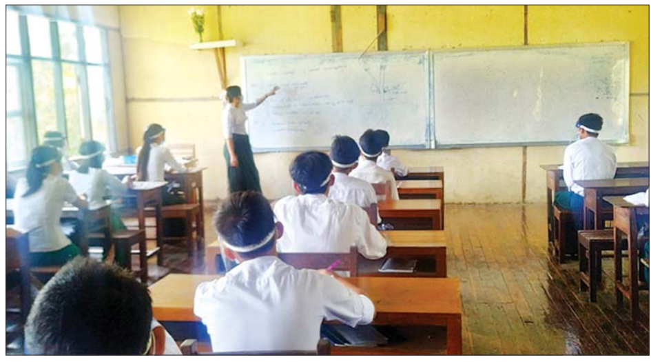
ကျောင်းသား ကျောင်းသူများ ပညာသင်ကြားနေမှုကို တွေ့ရစဉ်။

နေပြည်တော် ဇွန် ၃ ၂၀၂၁-၂၀၂၂ ပညာသင်နှစ်အတွက် အခြေခံပညာဦးစီးဌာနအောက်ရှိ အခြေခံပညာအထက်တန်းအဆင့်၊ အလယ်တန်းအဆင့်နှင့် မူလတန်းအဆင့်ကျောင်းများအား ဇွန် ၁ ရက်မှစ၍ မြန်မာနိုင်ငံတစ်ဝန်း၌ တစ်ပြိုင်တည်း အေးချမ်းတည်ငြိမ်စွာ စတင်ဖွင့်လှစ်သင်ကြားလျက်ရှိသည်။