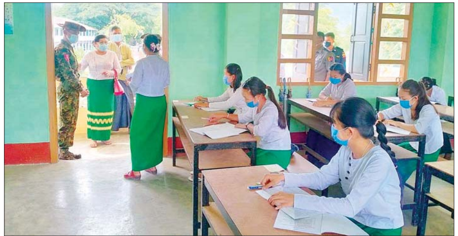
ရှမ်းပြည်နယ်အရှေ့ပိုင်း မိုင်းပျဉ်းမြို့၌ ကျောင်းသား ကျောင်းသူများ ပညာသင်ကြားနေမှုကို တာဝန်ရှိသူ များ သွားရောက်ကြည့်ရှုစစ်ဆေးစဉ်။ မြို့နယ်(ပြန်/ဆက်)