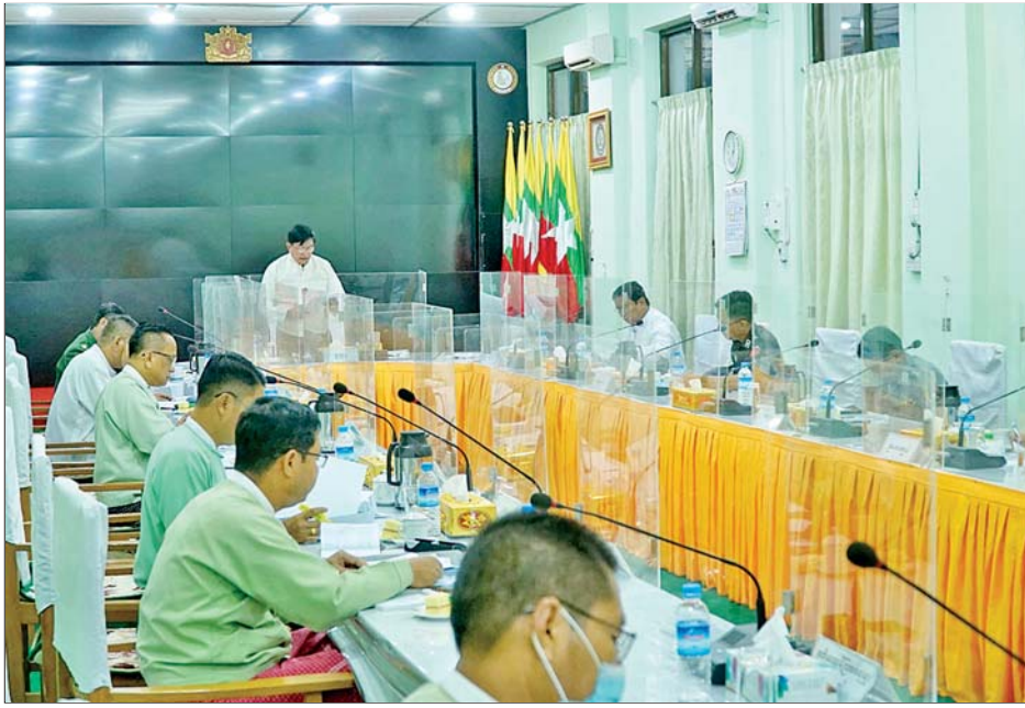
မပြတ်နိုးဆော် ဆောင်ရွက်ရမည် ဖြစ်ကြောင်း မှာကြားသည်။ ဆက်လက်ပြီး တိုင်းဒေသ ကြီး ပြည်သူ့ကျန်းမာရေးနှင့် ကုသရေးဦးစီးဌာနမှူးက တိုင်း ဒေသကြီးအတွင်း ကိုဗစ်-၁၉ ရောဂါပြန်လည်တွေ့ရှိလာရသည့် အခြေအနေကို တင်ပြပြီး တိုင်းဒေသကြီး ကိုဗစ်-၁၉

တုံ့ပြန်ရေးကော်မတီ၏ ကြီးကြပ် မှုဖြင့် ကျန်းမာရေးနှင့် အားကစား ဝန်ကြီးဌာနနှင့် အခြားဌာန ဆိုင်ရာများ ပူးပေါင်းကာ ကိုဗစ်- ၁၉ ရောဂါဖြစ်ပွားမှု ကာကွယ် ထိန်းချုပ်နိုင်ရေး တိုးမြှင့် ဆောင်ရွက်မည့် အစီအမံများကို တိုင်းဒေသကြီးအတွင်းရှိ မြို့နယ် များမှ သိရှိလိုက်နာ ဆောင်ရွက် နိုင်ရန် အမြန်ဆုံး ဆောင်ရွက်ရ မည်ဖြစ်ကြောင်း၊ ရောဂါ ကာကွယ်ရေးအတွက် အဓိက အခြေခံ အချက်များဖြစ်သည့် နှာခေါင်းစည်းများ တပ်ဆင်ခြင်း၊ လက်ကို စနစ်တကျ ဆေးကြော ခြင်း၊ လူတစ်ဦးနှင့် တစ်ဦး ခပ်ခွာခွာ နေထိုင်ခြင်း၊ လူစုလူဝေး ရှောင်ခြင်း စသည့်အခြေခံ လိုက်နာရမည့် အချက်များကို လူတိုင်းလိုက်နာကြရန် အဆက်