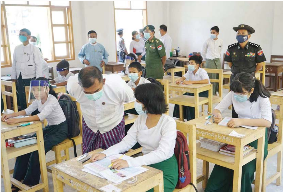
တနင်္သာရီတိုင်းဒေသကြီး စီမံအုပ်ချုပ်ရေးကောင်စီဥက္ကဋ္ဌ ဦးတင်အောင်နှင့် အဖွဲ့ဝင်များ ထားဝယ်မြို့နယ်ရှိ အခြေခံပညာ ကျောင်းများသို့ သွားရောက်၍ ကျောင်းသား ကျောင်းသူများအား အားပေးစကားပြောကြားစဉ်။ တိုင်းဒေသကြီး (ပြန်/ဆက်)

၂၀၂၁ ခုနှစ် ဇွန် ၁ ရက်တွင် နိုင်ငံတစ်ဝန်းရှိ အခြေခံပညာ (အထက်တန်း၊ အလယ်တန်း၊ မူလတန်း) ကျောင်းများကို စတင်ဖွင့်လှစ်ရာ ဇွန် ၃ ရက်တွင် မြို့နယ်အချို့၌ ကျောင်းသား ကျောင်းသူများ လာရောက် ကျောင်းတက်မှုနှင့် ပညာသင်ကြားနေမှုမြင်ကွင်းများကို စုစည်းဖော်ပြအပ်ပါသည်။