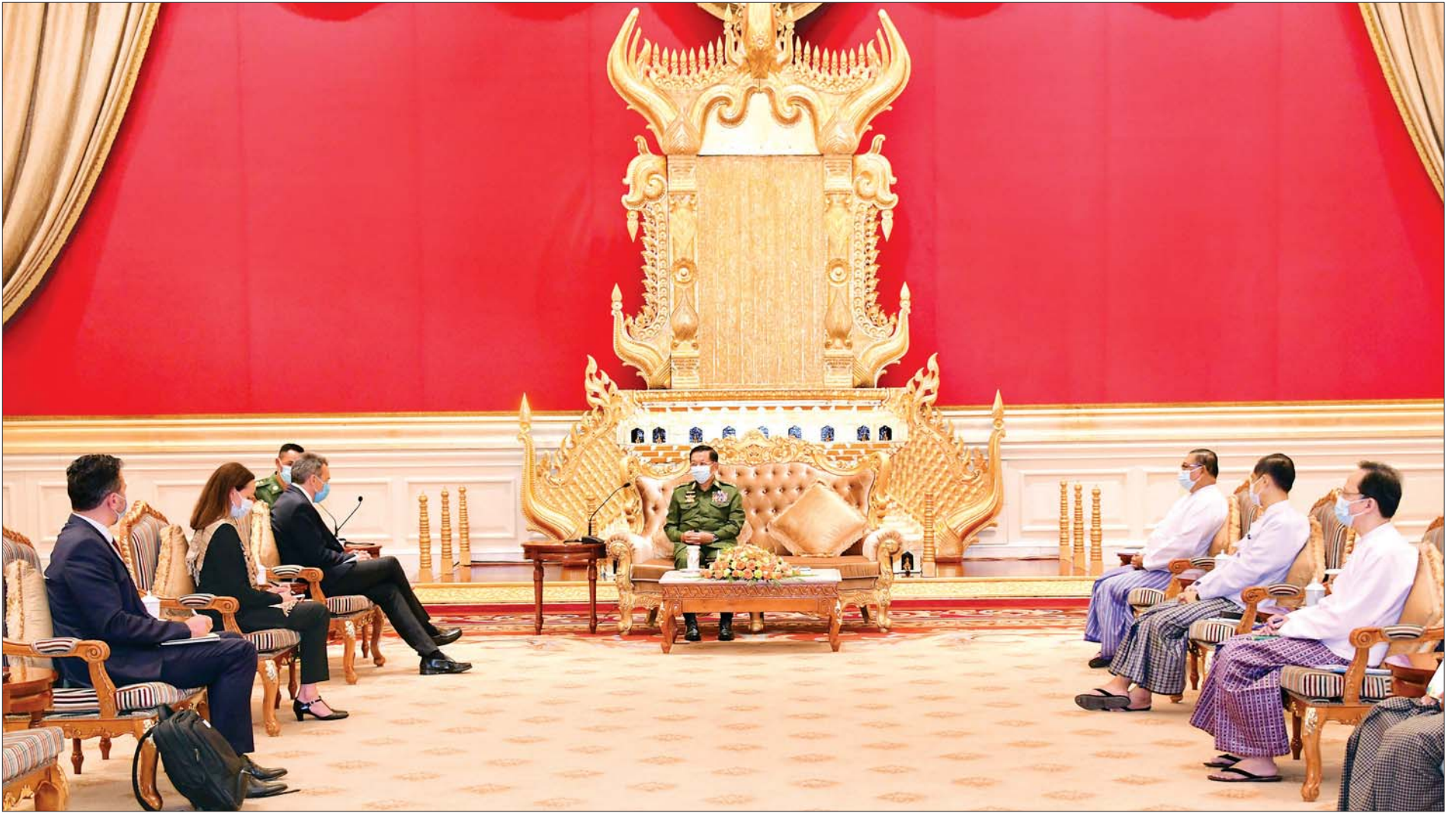
နိုင်ငံတော်စီမံအုပ်ချုပ်ရေးကောင်စီဥက္ကဋ္ဌ၊ တပ်မတော်ကာကွယ်ရေးဦးစီးချုပ် ဗိုလ်ချုပ်မှူးကြီး မင်းအောင်လှိုင် အပြည်ပြည်ဆိုင်ရာကြက်ခြေနီကော်မတီ (ICRC) ဥက္ကဋ္ဌ Mr. Peter Maurer ဦးဆောင်သည့် ကိုယ်စားလှယ်အဖွဲ့အား လက်ခံတွေ့ဆုံစဉ်။