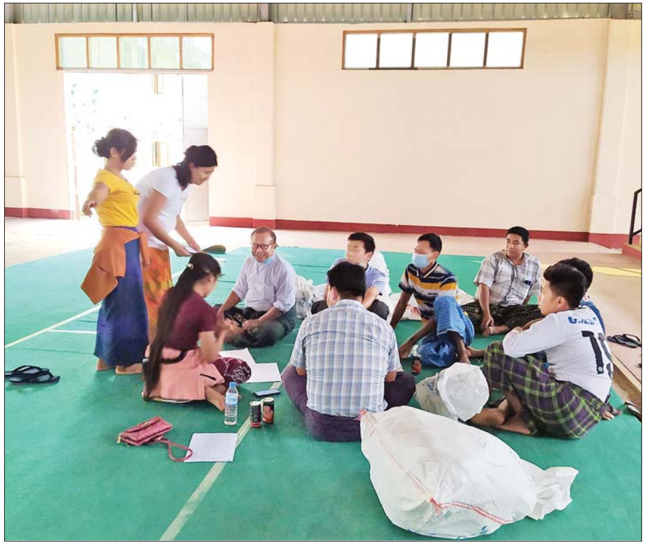
ဝိုင်းမော်မြို့နယ် ဆန္ဒမဲလက်မှတ်မြေပြင်စစ်ဆေးမှု မှတ်တမ်းဓာတ်ပုံ။