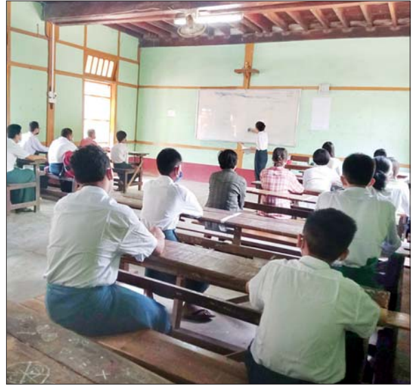
ပခုက္ကူမြို့နယ်၌ ကျောင်းသား ကျောင်းသူများ ပညာသင်ကြားနေမှု ကို တွေ့ရစဉ်။ ခရိုင်(ပြန်/ဆက်)