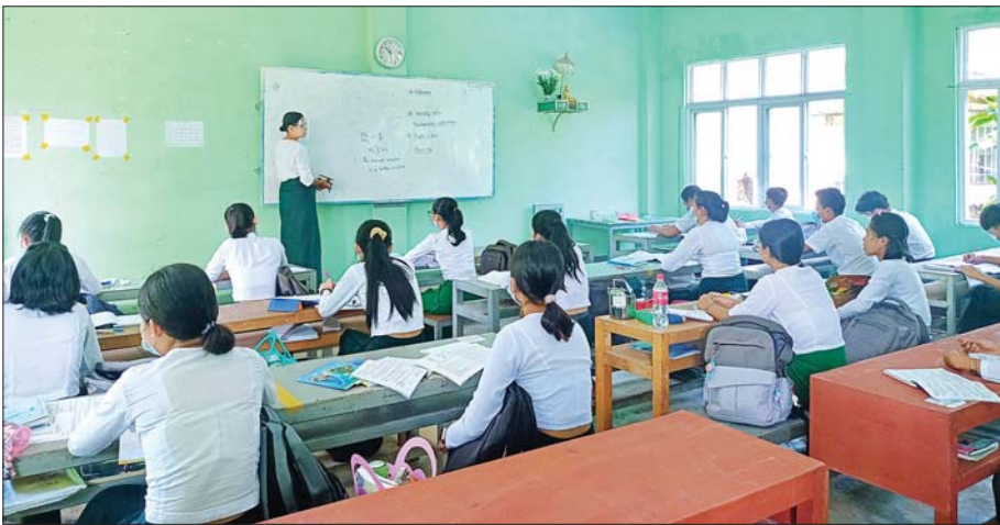
မုဒုံမြို့နယ်၌ ကျောင်းသား ကျောင်းသူများ ပညာသင်ကြားနေမှုကို တွေ့ရစဉ်။ မြို့နယ်(ပြန်/ဆက်)