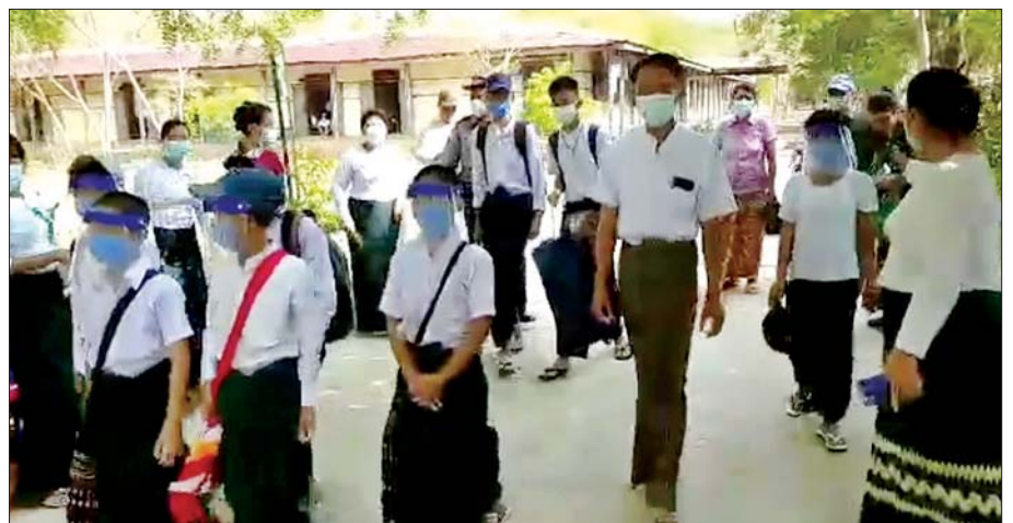
မြို့သစ်မြို့နယ်၌ ကျောင်းသား ကျောင်းသူများ ပညာသင်ကြားရန် ကျောင်းတက်လာသည်ကို တွေ့ရစဉ်။ ခရိုင်(ပြန်/ဆက်)

ကျောက်မဲ မြို့နယ်၌ ကျောင်းသား ကျောင်းသူများ ပညာသင်ကြား နေမှုကို တွေ့ရစဉ်။ မြို့နယ် (ပြန်/ဆက်)