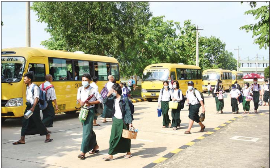
ကျောင်းသား ကျောင်းသူများ ပညာသင်ကြားရန် ကျောင်းတက်လာသည်ကို တွေ့ရစဉ်။

“ကျောင်းဖွင့်တဲ့ ဇွန် ၁ ရက်နေ့မှာ ကျောင်းတက် ရာခိုင်နှုန်းက ၇၆ ဒသမ ၂ ရာခိုင်နှုန်းရှိပါတယ်။ အခုကာလက ကိုဗစ်-၁၉ ဖြစ်နေတော့ ကျန်းမာရေးနှင့် အားကစားဝန်ကြီးဌာနက ထုတ်ပြန်ထားတဲ့ COVID-19 Version 1.4 နဲ့အညီ ကျောင်းတွေကို ဖွင့်လှစ်တာဖြစ်တဲ့ အတွက် တချို့ကလေးတွေက