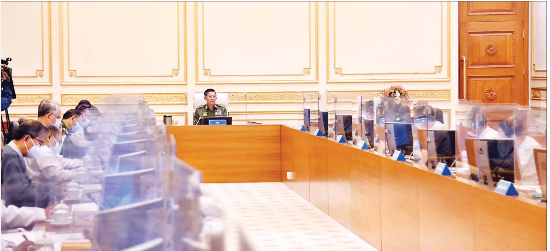
နိုင်ငံတော်စီမံအုပ်ချုပ်ရေးကောင်စီဥက္ကဋ္ဌ၊ တပ်မတော်ကာကွယ်ရေးဦးစီးချုပ် ဗိုလ်ချုပ်မှူးကြီး မင်းအောင်လှိုင် နိုင်ငံတော်စီမံအုပ်ချုပ်ရေးကောင်စီ စီမံခန့်ခွဲရေးကော်မတီအစည်းအဝေး (၈/၂၀၂၁) တွင် အမှာစကား ပြောကြားစဉ်။