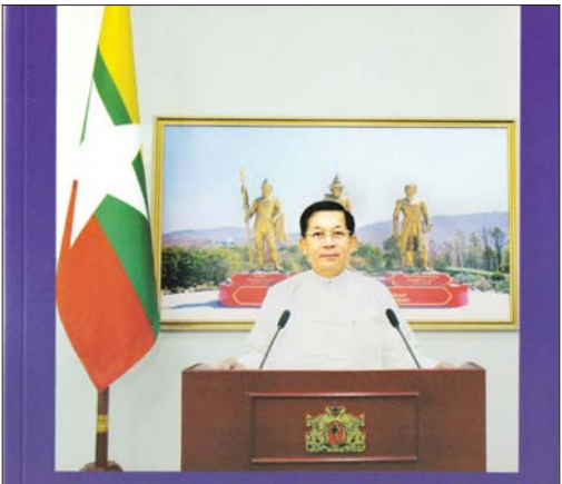
နိုင်ငံတော်စီမံအုပ်ချုပ်ရေးကောင်စီ ဥက္ကဋ္ဌ တပ်မတော်ကာကွယ်ရေးဦးစီးချုပ် ဗိုလ်ချုပ်မှူးကြီးမင်းအောင်လှိုင် ပြောကြားခဲ့သည့် မိန့်ခွန်းများ ( ၂၀၂၁ ခုနှစ်၊ ဧပြီလ )

ယင်းစာအုပ်ကို အမြို့မြို့အနယ်နယ်ရှိ ပြန်ကြားရေးနှင့် ပြည်သူ့ဆက်ဆံရေးဦးစီးဌာနရုံးများနှင့် ရန်ကုန်မြို့ရှိ စာပေဗိမာန်စာအုပ်အရောင်းဆိုင်၊ သတင်းနှင့်စာနယ်ဇင်းလုပ်ငန်း စာအုပ်အရောင်းဆိုင်တို့တွင် တစ်အုပ်လျှင် ငွေကျပ် ၁၀၀၀ နှုန်းဖြင့် ဝယ်ယူရရှိနိုင် သတင်းစဉ်