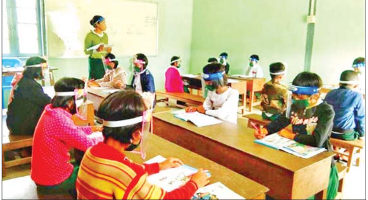
ပင်လောင်းမြို့နယ်၌ ကျောင်းသား ကျောင်းသူများ ပညာသင်ကြားနေမှု။ (ပြန်/ဆက်)