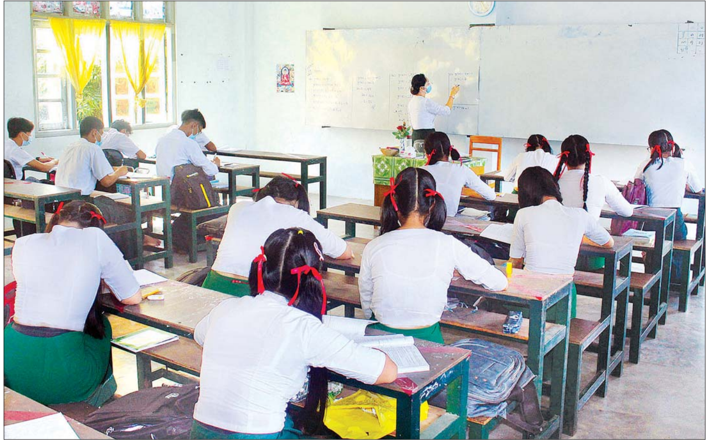
မြိတ်မြို့၌ ကျောင်းသား ကျောင်းသူများ အေးချမ်းစွာ ပညာသင်ကြားနေမှုကို တွေ့ရစဉ်။

တွဲဖွဲ့ဆင်မှုမှာ ရိုးရိုးတန်းသုံးတွဲ၊ လုပ်ကိတ် တစ်တွဲ၊ ဘရိတ်တွဲတစ်တွဲ စုစုပေါင်း ငါးတွဲဖြင့် ပြေးဆွဲပေးမည်ဖြစ်ကာ ဘူတာစဉ်ရပ်တန့်ပေး မည် ဖြစ်ပြီး မိဘပြည်သူများ အဆင်ပြေစွာ သွားလာနိုင်ရေးအတွက် သက်ဆိုင်ရာ ဘူတာ အသီးသီးတွင် ကြေညာထားပြီးဖြစ်ကြောင်း သိရသည်။ သတင်းစဉ်