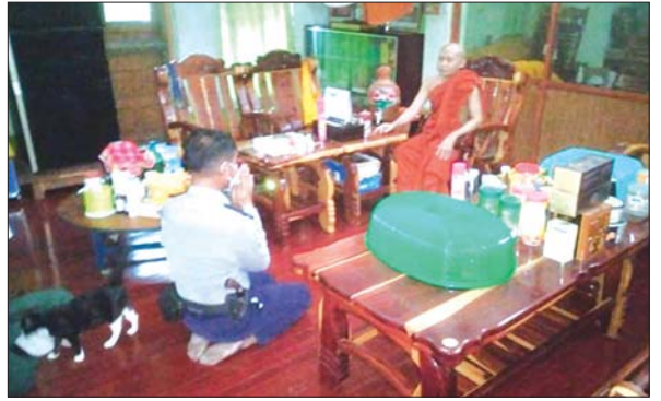
ရေးသားဖော်ပြထားမှုနှင့်ပတ်သက်၍ မစိုးရိမ်တိုက်သစ် ဓမ္မဂါရဝ ကျောင်းမှ မြို့နယ်သံဃာနာယကဥက္ကဋ္ဌ ဆရာတော်အား အုပ်ချုပ် ရေးပိုင်းဆိုင်ရာ တာဝန်ရှိသူက သွားရောက်လျှောက်ထား အတည် ပြုနေမှု။

သို့ဖြစ်ပါ၍ အများပြည်သူလူထုအနေဖြင့် မီဒီယာအချို့၏ သတင်း