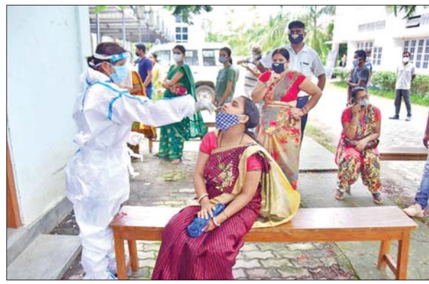
အိန္ဒိယနိုင်ငံ အာသံပြည်နယ်တွင် ကျန်းမာရေးဝန်ထမ်းတစ်ဦးက ကိုဗစ်-၁၉ စစ်ဆေးရန် နှာခေါင်းတို့ဖတ်မှုရုံမှာ ရယူနေသည့်ကို တွေ့ရစဉ်။

နယူးဒေလီ ဇွန် ၃ အိန္ဒိယနိုင်ငံ၏ ကိုဗစ်-၁၉ ကူးစက်ဖြစ်ပွားသူအရေအတွက်သည် ဇွန် ၃ ရက်က ၁၃၄၅၄၄ ဦး တိုးလာပြီး စုစုပေါင်းကိုဗစ်-၁၉ ကူးစက်ဖြစ်ပွားသူ ၂၈၄၄၀၉၈၆ ဦးအထိ ရှိလာခဲ့ကြောင်း ကျန်းမာရေးဝန်ကြီးဌာနက သတင်းထုတ်ပြန် ဖော်ပြလိုက်သည်။ ဇွန် ၂ ရက် နံနက်ပိုင်း ခဲ့သည်။ ကတည်းက ကိုဗစ်-၁၉ ကြောင့် နိုင်ငံတစ်ဝန်း ကိုဗစ်-၁၉ ၂၈၈၇ ဦး ထပ်မံသေဆုံးခဲ့ရာ ကင်းစင်သွားပြီး ဆေးရုံမှ ဆင်းစုစုပေါင်း ကိုဗစ်-၁၉ ကြောင့် လာသူ ၂၆၃၉၀၅၈၄ ဦး ရှိလာခဲ့သည်။ ယူနီဆက်မ်မြန်မာ နိုင်ငံအနှံ့ ကိုဗစ်-၁၉ ကာကွယ်ဆေးထိုးနှံခြင်းကို ဇန်နဝါရီလတွင် စတင်ခဲ့ပြီး ယခုအချိန်အထိ ကိုဗစ်-၁၉ ကာကွယ်ဆေးထိုးပြီးသူ ၂၂၀ သန်းကျော်ရှိခဲ့သည်။ လတ်တလောတွင် တတိယ အသုတ် ကိုဗစ်-၁၉ ကာကွယ်ဆေး ထိုးနှံခြင်းများကို ဆောင်ရွက်