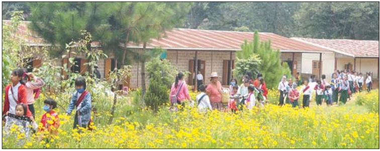
နောင်တရားမြို့နယ်၌ ပညာသင်ကြားကြမည့် ကျောင်းသား ကျောင်းသူများကို တွေ့ရစဉ်။ မြို့နယ်(ပြန်/ဆက်)