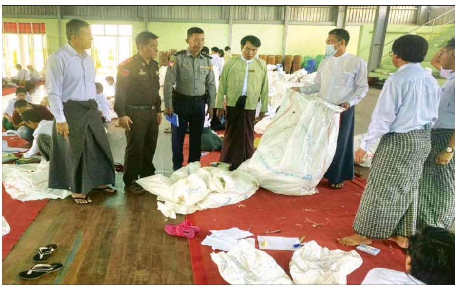
မိုင်းရှူးမြို့နယ် ဆန္ဒမဲလက်မှတ် မြေပြင်စစ်ဆေးမှု မှတ်တမ်းဓာတ်ပုံ။

၅။ မြေပြင်စစ်ဆေးချက်များအရ အဆိုပါ ၇ မြို့နယ်တွင် မဲရုံပေါင်း ၂၈၃ ရုံ၊ စုစုပေါင်းထုတ်ယူရရှိခဲ့သော ဆန္ဒမဲလက်မှတ်အရေအတွက်မှာ ၂၆၄၃၉၂ ဖြစ်ပြီး မဲပေးအသုံးပြုခဲ့သော လက်မှတ်ဖြတ်ပိုင်းများမှာ ၁၄၀၆၄၈၊ ကျန်ရှိရမည့်အရေအတွက်မှာ ၁၂၃၇၄၄၊ မြေပြင်လက်ကျန် ၁၂၃၆၆၇ဖြစ်ကြောင်း တွေ့ရှိရသည်။ ကွာခြားချက်အနေဖြင့် ကျန်ရှိရမည့်အရေအတွက်ထက် လျော့နည်းသော မဲလက်မှတ်အရေအတွက် ၁၄၃၆ ဖြစ်ပြီး၊ အပိုတွေ့ရှိရသော မဲလက်မှတ်အရေအတွက်မှာ ၁၃၈၅၈ ဖြစ်သည်။ မြို့နယ်အလိုက် ဆန္ဒမဲလက်မှတ်များ လျော့နည်းပျောက်ဆုံးခြင်း၊ တရားမဝင် အပိုရရှိနေခြင်းတို့ကို တွေ့ရှိရသည်။ မြို့နယ်တစ်မြို့နယ်ချင်းအလိုက် စိစစ်တွေ့ရှိချက်များမှာ အောက်ပါအတိုင်းဖြစ်သည်-