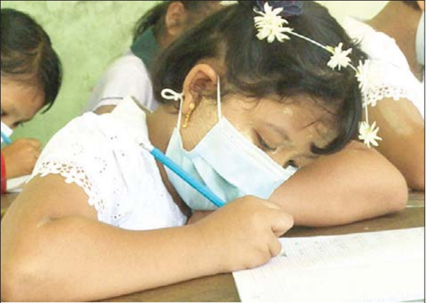
အောင်မြေသာစံမြို့နယ် အမှတ်(၆)အခြေခံပညာ မူလတန်းလွန် ကျောင်း၌ ကျောင်းသူလေးတစ်ဦး စိတ်ပါဝင်စားစွာ ပညာသင်ယူ နေမှုကို တွေ့ရစဉ်။ မောင်အေးချမ်း