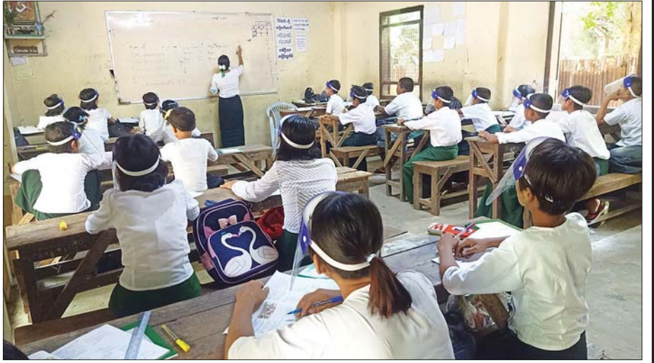
ပန်းတနော်မြို့နယ် အထက(၁) တွင် ကျောင်းသား ကျောင်းသူများ ပညာသင်ကြားနေမှုကို တွေ့ရစဉ်။ မြို့နယ်(ပြန်/ဆက်)