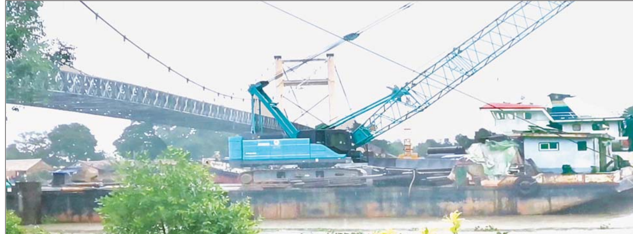
ပဗ္ဗဝတီတံတားအား တံတားခံနိုင်ဝန် အဆင့်မြှင့်တင် တည်ဆောက်မှုကို တွေ့ရစဉ်။

ပုသိမ် ဇွန် ၂ ဆက်သွယ်ပေးထားသည့် အဓိက ဖြစ်သည့်အတွက် တံတား အဆိုပါ တံတားသည် ယခင် ဧရာဝတီတိုင်းဒေသကြီး ပုသိမ်- တံတားဖြစ်သည်။ အဟောင်းကိုဖြုတ်ပြီး သံကူ ကံကုန်း-မြင်းကဆိပ်-မြောင်းမြ မူလပဗ္ဗဝတီတံတား (မြင်း ကွန်ကရစ် ကြမ်းခင်းအဖြစ် သံကူ ကဆိပ်)ကြီးတံတားမှာ တံတား အဆင့်မြှင့်တင် တည်ဆောက် ခံနိုင်ရည်အား ကျဆင်းလာပြီ မည်ဖြစ်သည်။ စာမျက်နှာ ၈ ကော်လံ ၅ ❖