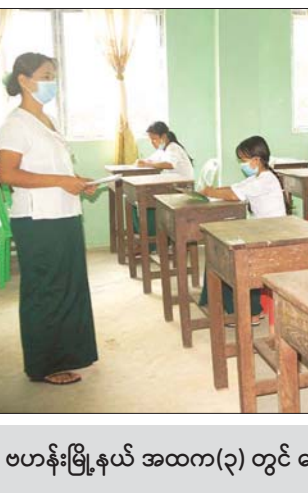
ဗဟန်းမြို့နယ် အထက(၃) တွင် ကျောင်းသား ကျောင်းသူများ ပညာသင်ကြားနေမှုကို တွေ့ရစဉ်။

ရေးသီတင်းပတ်အဖြစ် ၂၀၂၁ ခုနှစ် မေ ၂၄ ရက်မှ ၃၁ ရက်အထိ သတ်မှတ်ထားပြီး မည်သည့် အခကြေးငွေမှ ကောက်ခံမှုမရှိဘဲ ပုံနှိပ်စာအုပ်၊ ဗလစာအုပ်၊ ခဲတံ၊ ပေတံ စသည်တို့ကိုလည်း အခမဲ့ ထောက်ပံ့ပေးအပ်မည် ဖြစ်