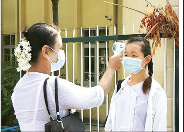
အောင်မြေသာစံမြို့နယ် အမှတ် (၁၈) အခြေခံပညာ အထက်တန်း ကျောင်း၌ ကျောင်းသူတစ်ဦးအား ကိုယ်အပူချိန်တိုင်းပေးနေစဉ်။ မောင်အေးချမ်း