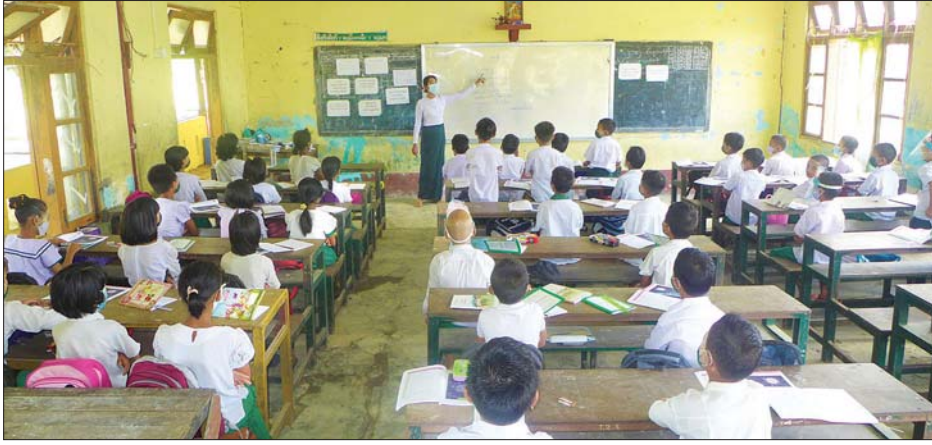
ဒလမြို့နယ် အထက(၄) တွင် ကျောင်းသား ကျောင်းသူများ ပညာသင်ကြားနေမှုကို တွေ့ရစဉ်။

မြန်မာတစ်နိုင်ငံလုံးရှိ အခြေခံပညာကျောင်းများကို ဇွန် ၁ ရက်တွင် စတင်ဖွင့်လှစ်ခဲ့ရာ ရန်ကုန်တိုင်းဒေသကြီးအတွင်းရှိ အခြေခံပညာထက်၊ လယ်၊ မူကျောင်းသား ၁၇၂၃၉၉ ဦး၊ ဘုန်းတော်ကြီးသင်ပညာရေးကျောင်း ၉၅၃၈ ဦး၊ ကိုယ်ပိုင်ကျောင်း ၁၇၃၃ ဦး တက်ရောက်ခဲ့ကြောင်း သိရသည်။ ဇွန် ၂ ရက်တွင် ကျောင်းသားအရေအတွက် ၂၅၆၈၁၈ ဦး တက်ရောက်ကြကြောင်း တိုင်းပညာရေးဦးစီးဌာနမှ သိရသည်။