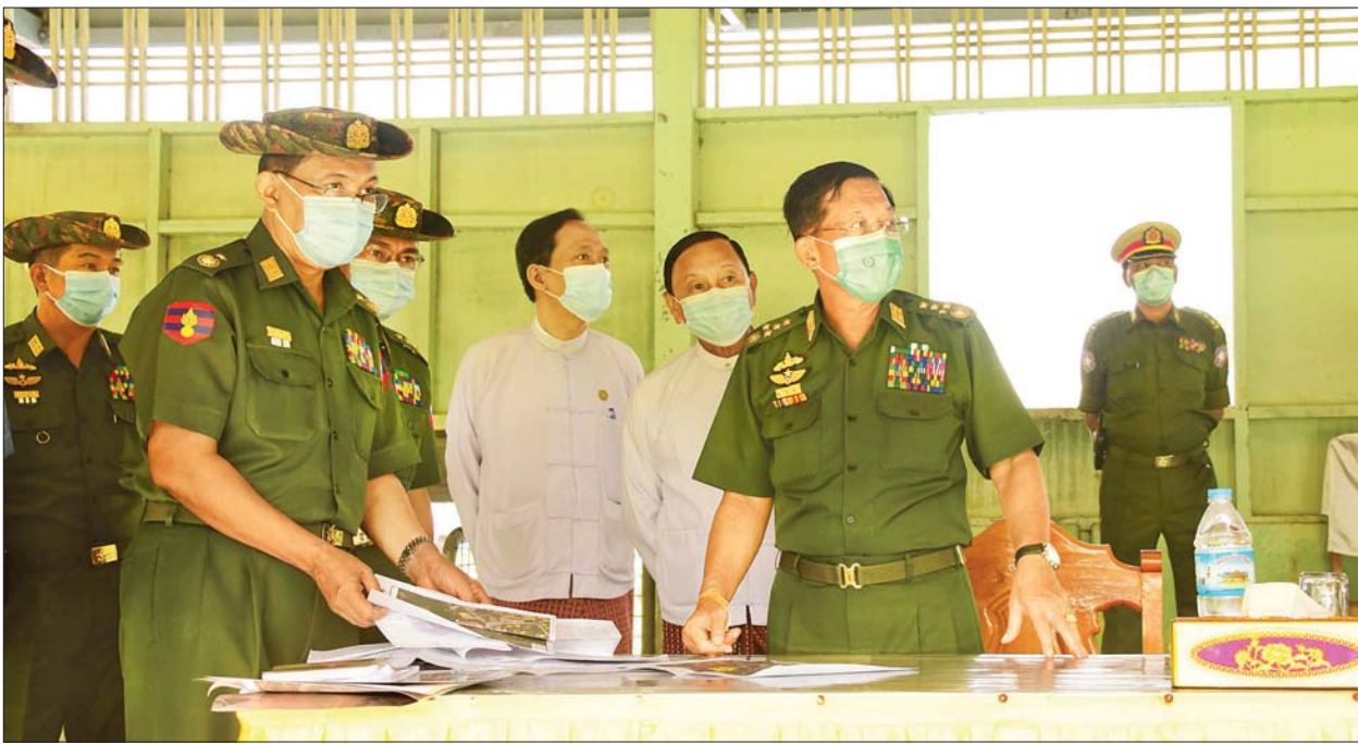
နေပြည်တော် ဇွန် ၂

နိုင်ငံတော်စီမံအုပ်ချုပ်ရေးကောင်စီဥက္ကဋ္ဌ၊ တပ်မတော်ကာကွယ်ရေးဦးစီးချုပ် ဗိုလ်ချုပ်မှူးကြီး မင်းအောင်လှိုင်သည် ဇနီး ဒေါ်ကြူကြူလှ၊ ကောင်စီဝင်များ ဖြစ်ကြသည့် ဗိုလ်ချုပ်ကြီး တင်အောင်စန်း၊ ဗိုလ်ချုပ်ကြီး မောင်မောင်ကျော်နှင့် ဇနီး၊ ဒုတိယဗိုလ်ချုပ်ကြီး မိုးမြင့်ထွန်း၊ မန်းငြိမ်းမောင်၊ ဒေါက်တာ ဗညားအောင်မိုး၊ ကောင်စီတွဲဖက်အတွင်းရေးမှူး ဒုတိယဗိုလ်ချုပ်ကြီး ရဲဝင်းဦး၊ ပြည်ထောင်စုဝန်ကြီးများ ဖြစ်ကြသည့် ဒေါက်တာ ညွန့်ဖေ၊ ဒေါက်တာ သက်ခိုင်ဝင်း၊ ဦးရွှေလေး၊ ကာကွယ်ရေးဦးစီးချုပ် (ရေ) ဗိုလ်ချုပ်ကြီး မိုးအောင်နှင့် ဇနီး၊ ကာကွယ်ရေးဦးစီးချုပ်ရုံးမှ တပ်မတော်အရာရှိကြီးများနှင့် ဇနီးများ၊ မွန်ပြည်နယ် စီမံအုပ်ချုပ်ရေးကောင်စီဥက္ကဋ္ဌ ဦးဇော်လင်းထွန်း၊ အရှေ့တောင်တိုင်းစစ်ဌာနချုပ် တိုင်းမှူး ဗိုလ်ချုပ် ကိုကိုမောင်နှင့် အဖွဲ့ဝင်များနှင့် အတူ ယနေ့ နံနက်ပိုင်းတွင် မော်လမြိုင်မြို့ မောင်ငံရပ်ရှိ မြစေတီပရိယတ္တိ စာသင်တိုက်ဦးစီးပဓာန နာယက ဆရာတော် ဓမ္မာစရိယဝိနယ