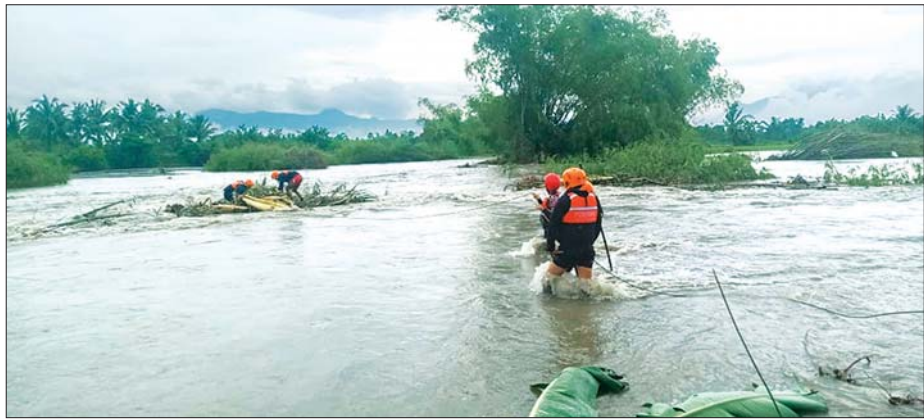
ဖိလစ်ပိုင်နိုင်ငံ ကိုတာဘာတိုတောင်ပိုင်းကို အပူပိုင်းမုန်တိုင်းဝင်ရောက်တိုက်ခတ်ပြီးနောက် ပျောက်ဆုံးသူ တစ်ဦးအား ရှာဖွေနေသည်ကို တွေ့ရစဉ်။

ဘေးလွတ်ရာသို့ ပြောင်းရွှေ့ပေးခဲ့ရသည်။ မိုးလေဝသဌာနက အပူပိုင်းမုန်တိုင်းသည် အော်ရီရန်တယ်မင်ဒိုရိုကမ်းလွန်ပင်လယ်ပြင်တွင် ဖြစ်ပွားခဲ့ပြီး ဘာတန်ဂက်စ်ပြည်နယ် အနောက် မြောက်ကမ်းရိုးတန်းသို့ ဦးတည်သွားကြောင်း ဖော်ပြသည်။ မုန်တိုင်းသည် တစ်နာရီလျှင် ၁၅ ကီလိုမီတာနှုန်း ဖြင့် အနောက်-အနောက်မြောက်ယွန်းယွန်းသို့ ရွေ့လျားသွားပြီး တစ်နာရီလျှင် ၆၅ ကီလိုမီတာမှ ၉၀ ကီလိုမီတာ အထိ တိုက်ခတ်သည်။ အဆိုပါ မုန်တိုင်းသည် ဇွန် ၄ ရက်အထိ ဆက်လက်တည်ရှိ နေဦးမည်ဖြစ်ကြောင်း မိုးလေဝသဌာနက ခန့်မှန်း ထားသည်။ တိုင်ဖွန်းမုန်တိုင်းများနှင့် အပူပိုင်းမုန်တိုင်းများ သည် ဖိလစ်ပိုင်နိုင်ငံသို့ ပုံမှန်ဝင်ရောက်တိုက်ခတ် လေ့ရှိရာ လူ့အသက်ပေါင်း ရာကျော်နှင့် အမေရိကန်