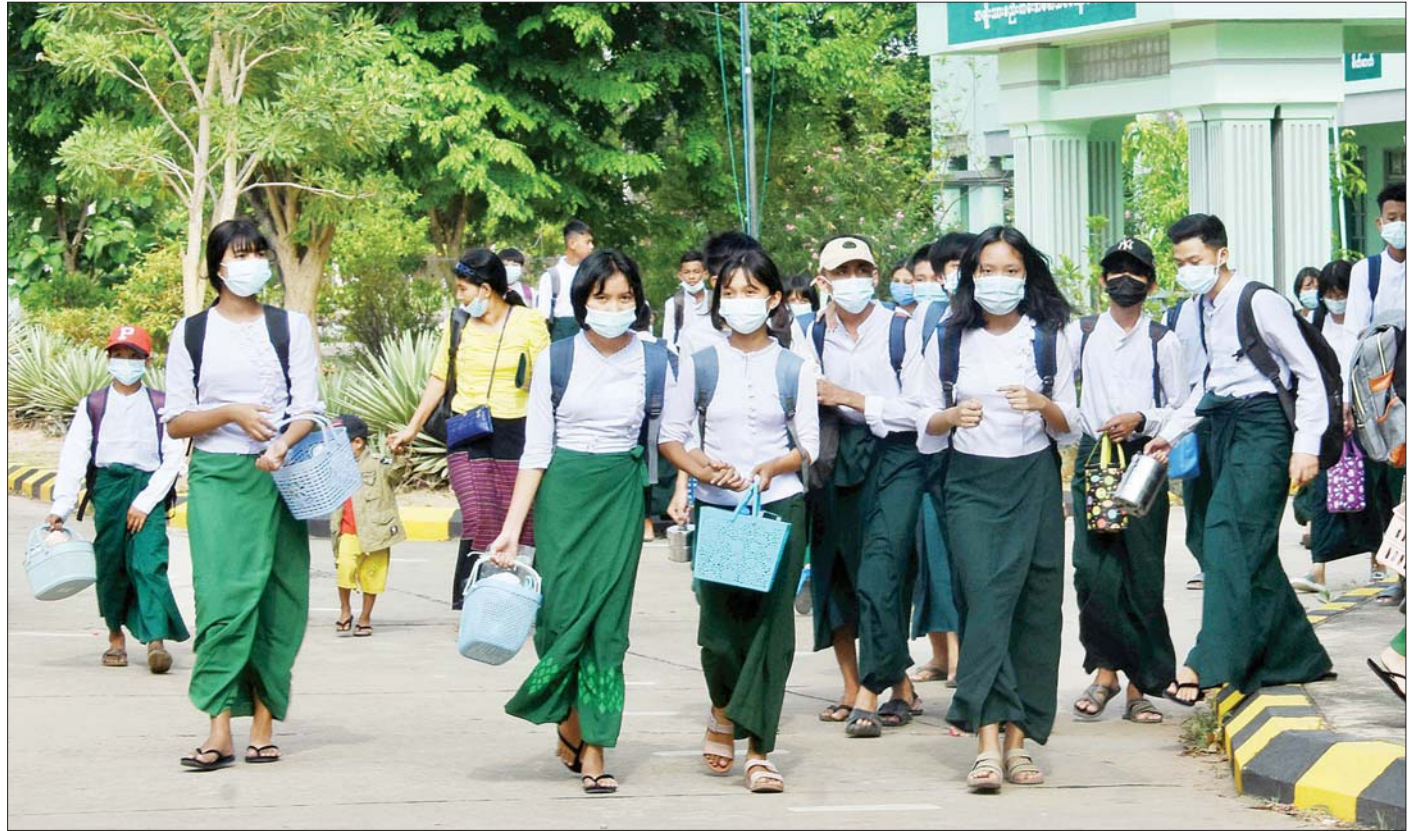
နေပြည်တော် အထက (၇) မှ ကျောင်းသား ကျောင်းသူများကို တွေ့ရစဉ်။ သတင်းစဉ်

“ကျွန်တော်တို့ကျောင်းအနေနဲ့ ဇွန် ၁ ရက် မှာ ကျောင်းတက်ရာခိုင်နှုန်း ၆၉ ရာခိုင်နှုန်း ရှိပါတယ်။ စာမျက်နှာ ၁၀ ကော်လံ ၁ □