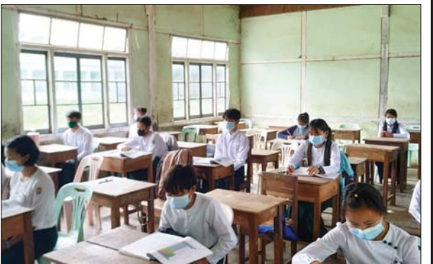
ပင်းတယမြို့နယ်၌ ကျောင်းသား ကျောင်းသူများ ပညာသင်ကြား နေမှုကို တွေ့ရစဉ်။ ပင်းတယ (ပြန်/ဆက်)