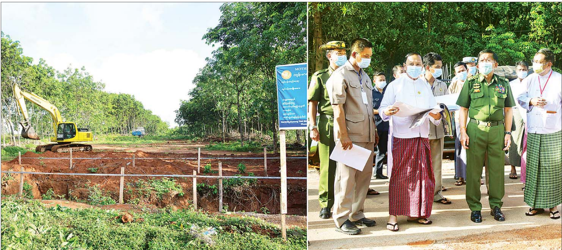
နိုင်ငံတော်စီမံအုပ်ချုပ်ရေးကောင်စီဥက္ကဋ္ဌ၊ တပ်မတော်ကာကွယ်ရေးဦးစီးချုပ် ဗိုလ်ချုပ်မှူးကြီး မင်းအောင်လှိုင်နှင့် အဖွဲ့ဝင်များ မော်လမြိုင်မြို့၊ မင်းရွာကျေးရွာအနီး တည်ဆောက်လျက်ရှိသည့် မွန်ပြည်နယ် အားကစားဥယျာဉ် တည်ဆောက်ရေးစီမံကိန်း အကောင်အထည်ဖော်ဆောင်ရွက်နေမှု အခြေအနေများကို ကြည့်ရှုစစ်ဆေးစဉ်။

(နိုင်ငံတော်စီမံအုပ်ချုပ်ရေးကောင်စီဥက္ကဋ္ဌ၊ တပ်မတော်ကာကွယ်ရေးဦးစီးချုပ် ဗိုလ်ချုပ်မှူးကြီး မင်းအောင်လှိုင်နှင့် အဖွဲ့ဝင်များ မော်လမြိုင်မြို့၊ မင်းရွာကျေးရွာအနီး တည်ဆောက်လျက်ရှိသည့် မွန်ပြည်နယ် အားကစားဥယျာဉ် တည်ဆောက်ရေးစီမံကိန်း အကောင်အထည်ဖော်ဆောင်ရွက်နေမှု အခြေအနေများကို ကြည့်ရှုစစ်ဆေးစဉ်။)