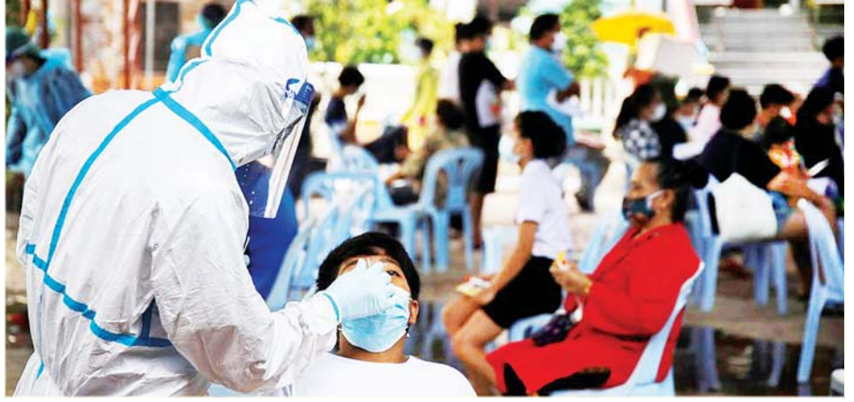
ထိုင်းနိုင်ငံ ဘန်ကောက်၌ ကျန်းမာရေးဝန်ထမ်းတစ်ဦးက ကိုဗစ်-၁၉ စစ်ဆေးရန် နှာခေါင်းတို့ဖတ်နမူနာ ရယူနေသည်ကို တွေ့ရစဉ်။

ဟောင်ကောင် ဇွန် ၂ ကိုဗစ်-၁၉ ကူးစက်ဖြစ်ပွားမှုများသည် အာရှ-ပစိဖိတ် နိုင်ငံများတွင် ဆက်လက်ကူးစက်ပျံ့နှံ့လျက်ရှိစဉ် အိန္ဒိယနိုင်ငံတွင် ဇွန် ၂ ရက်က ကိုဗစ်-၁၉ ထပ်မံ ကူးစက်ဖြစ်ပွားသူ ၁၃၂၇၈၈ ဦးရှိကြောင်း ဖော်ပြ လိုက်သည်။ ထိုင်းနိုင်ငံတွင်လည်း လူထုကာကွယ် ဆေးထိုးလှုပ်ရှားဆောင်ရွက်မှုများအတွက် ကိုဗစ်- ၁၉ ကာကွယ်ဆေးဖြန့်ဝေမှုများကို အင်တိုက်အား တိုက်လုပ်ဆောင်လျက်ရှိသည်။ အိန္ဒိယနိုင်ငံတွင် ကိုဗစ်-၁၉ ထပ်မံကူးစက် ဖြစ်ပွားသူ ၁၃၂၇၈၈ ဦး ပေါင်းထည့်လိုက်လျှင် စုစုပေါင်း ကိုဗစ်-၁၉ ကူးစက်ဖြစ်ပွားသူပေါင်း ၂၈၃၀၇၈၂ ဦးအထိ ရောက်ရှိလာခဲ့ကြောင်း ကျန်းမာရေးဝန်ကြီးဌာနက သတင်းထုတ်ပြန်ဖော်ပြ လိုက်သည်။ ထို့အပြင် ဇွန် ၁ ရက်အထိ ထပ်မံသေဆုံးသူ ၃၂၀၇ ဦးနှင့်အတူ ကိုဗစ်-၁၉ ကြောင့် သေဆုံးသူ စုစုပေါင်း မှာ ၃၃၅၀၂၂ ဦးရှိလာခဲ့သည်။ နိုင်ငံအတွင်း ကိုဗစ်-၁၉ ဖြစ်ပွားနေသူ ၁၇၉၃၆၄၅ ဦးရှိပြီး