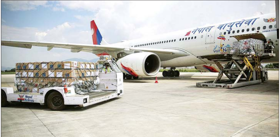
တရုတ်နိုင်ငံမှ ရောက်ရှိလာသော ကိုဗစ်-၁၉ ကာကွယ်ဆေးများကို တွေ့ရစဉ်။

နယူးဒေလီ ဇွန် ၂ ဧပြီမှ မေလအတွင်း အိန္ဒိယနိုင်ငံ၏ ဒုတိယအကြိမ် ကိုဗစ်-၁၉ ကြောင့် ဆရာဝန် ၅၉၄ ဦးသေဆုံးခဲ့ကြောင်း အိန္ဒိယဆေးဘက် ဆိုင်ရာအဖွဲ့က ဇွန် ၂ ရက်က သတင်းထုတ်ပြန်ဖော်ပြလိုက်သည်။ မြို့တော်ဒေလီသည် ဆရာဝန်သေဆုံးမှု အမြင့်ဆုံးဖြစ်ကာ စုစုပေါင်း ၁၀၇ ဦးသေဆုံးသည်။ ထို့နောက် ဘီဟာတွင် ၉၆ ဦး ဥတရာပရာဒေသတွင် ၆၇ ဦး သေဆုံးကြောင်း သိရသည်။ သို့သော် တကယ့်သေဆုံးမှုသည် လက်ရှိစာရင်းဖော်ပြချက်နှင့် ကွာဟ ချက်ရှိနိုင်ကြောင်း အိန္ဒိယဆေးဘက်ဆိုင်ရာအဖွဲ့က ပြော သည်။ အိန္ဒိယသည် ကိုဗစ် ဒုတိယအကြိမ်ကို အဆိုးဆုံးခံစားခဲ့ရပြီး နေ့စဉ်ကိုဗစ်-၁၉ ကူးစက်ဖြစ်ပွားသူ လေးသိန်းအထက်တိုးလာ ခဲ့သည်။ ထို့အတူ သေဆုံးသူ ၄၀၀၀ ကျော်ရှိသည့် ရက်ပေါင်း အတော်များခဲ့သည်။ သို့သော်လည်း လွန်ခဲ့သော ရက်အနည်းငယ် အတွင်း အိန္ဒိယနိုင်ငံတွင် ကိုဗစ်-၁၉ ထပ်မံကူးစက်ဖြစ်ပွား သူအရေအတွက်နှင့် သေဆုံးသည့်အရေအတွက် ကျဆင်းခဲ့ သည်။ ဆင်ယွာ