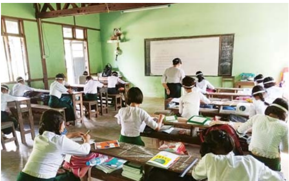
သရက်ချောင်းမြို့၌ ကျောင်းသား ကျောင်းသူများ ပညာသင်ကြား နေမှုကို တွေ့ရစဉ်။ မြို့နယ် (ပြန်/ဆက်)