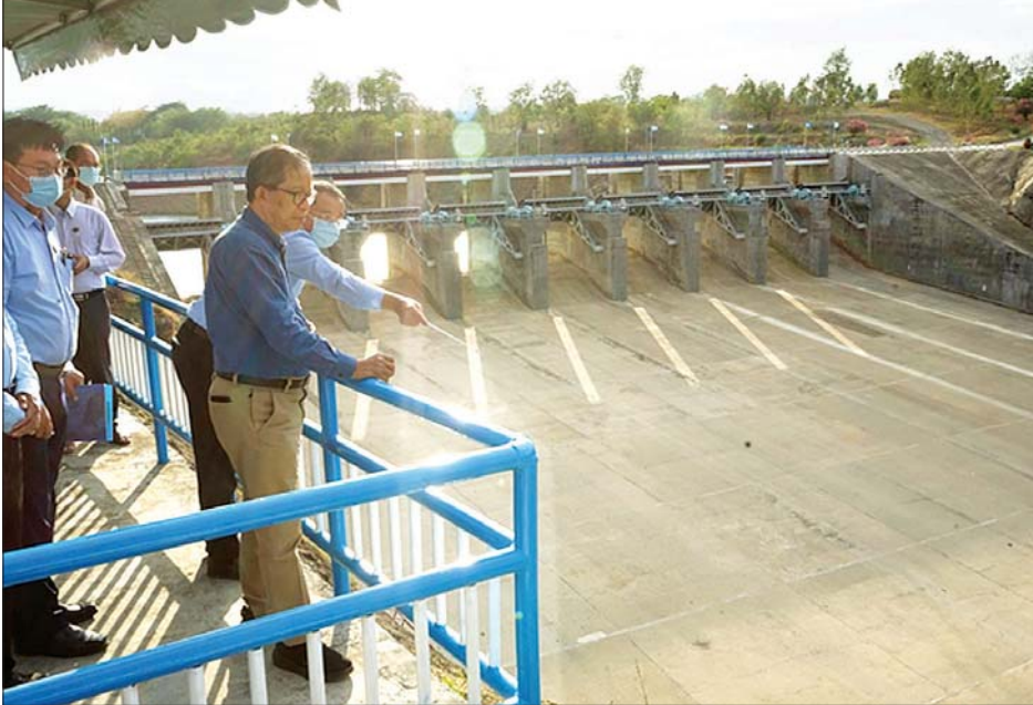
ပြည်ထောင်စုဝန်ကြီး ဦးတင်ထွဋ်ဦးနှင့် အဖွဲ့ဝင်များ ကြီးအုံကြီးဝ ရေလှောင်တံခါး ရေပိုလွှဲကို ကြည့်ရှုစစ်ဆေးစဉ်။

နေပြည်တော် ဇွန် ၂ - ၃၀ ရက်က မကွေးတိုင်းဒေသကြီး စီမံဆောင်ရွက်လျက်ရှိ စိုက်ပျိုးရေး၊ မွေးမြူရေးနှင့် ဒေသဖွံ့ဖြိုးရေးအဖွဲ့ဝန်ကြီး ဦးတင်ထွဋ်ဦးသည် မေကြည့်ရှုစစ်ဆေးသည်။