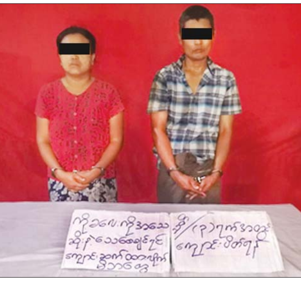
မင်းဘူးမြို့နယ်ရှိ မူကြိုကျောင်းကို မီးရှို့ဖျက်ဆီးသူများ ဖမ်းဆီးရမိစဉ်။

လုံခြုံရေးတပ်ဖွဲ့ဝင်များက ယနေ့ မွန်းလွဲပိုင်းတွင် အဆိုပါကျေးရွာအတွင်းရှိ ၎င်းတို့၏ နေအိမ်များတွင် သွားရောက်ဖမ်းဆီးခဲ့ရာ ကျောင်းများအား မီးရှို့ဖျက်ဆီးနေသည့် ကလေးများအား အသက်အန္တရာယ် ခြိမ်းခြောက်ထားသည့် စာသားများပါ စာရွက်များဖြင့် ဖမ်းဆီးရမိခဲ့သည်။ အဆိုပါ ဖမ်းဆီးရမိသူအား တရားဥပဒေနှင့်အညီ ပြင်းပြင်းထန်ထန် ထိရောက်စွာ အရေးယူနိုင်ရေးအတွက် ဆက်လက်ဆောင်ရွက်လျက် ရှိကြောင်း သတင်းရရှိသည်။ သတင်းစဉ်