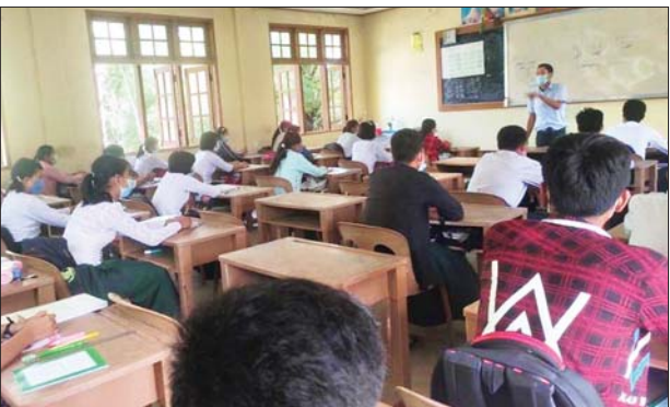
အင်္ဂပူမြို့နယ်၌ ကျောင်းသား ကျောင်းသူများ ပညာသင်ကြားနေမှုကို တွေ့ရစဉ်။ မန်းကျော်(ပြန်/ဆက်)