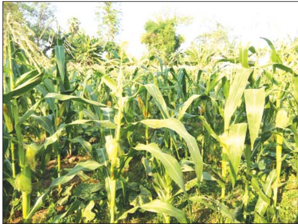
ရေသွင်းစိုက်ပျိုးထားသော ဖူးစားပြောင်းများ

ပြောင်းဖူးများ စိုက်ပျိုးရာတွင် ကြပ်ကဲခြင်း၊ အတန်းလိုက် အစေ့ချ စိုက်ပျိုးခြင်း စသည်ဖြင့် အမျိုးမျိုး ရှိသော်လည်း အတန်းလိုက် အစေ့ချ ၍ စနစ်တကျ စိုက်ပျိုးခြင်းဖြင့် ရေသွင်းခြင်း၊ ဆေးဖျန်းခြင်း၊ ပေါင်းမြက် များ ရင်းလင်းခြင်းများ ပြုလုပ်ပေးနိုင်သည့်အတွက်ကြောင့် ပြောင်းဖူး