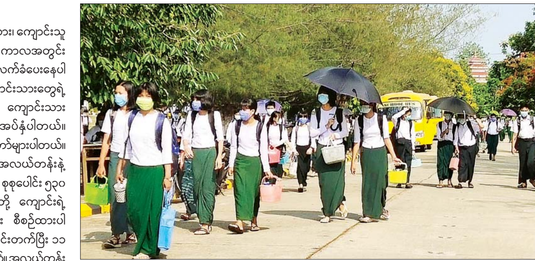
နေပြည်တော် အထက(၆) မှ ကျောင်းသား ကျောင်းသူများကို တွေ့ရစဉ်။

ကျောင်းမအပ်ရသေးတဲ့ ကျောင်းသား၊ ကျောင်းသူတွေ အတွက်လည်း ကျောင်းဖွင့်ချိန်ကာလအတွင်း မှာကျောင်းအပ်နှံမှုကို ဆက်လက်လက်ခံပေးနေပါတယ်။ ကျောင်းတက်ဖို့က ကျောင်းသားတွေရဲ့ အခွင့်အရေးဖြစ်ပါတယ်။ ဒီနေ့ကို ကျောင်းသားအသစ်အနေနဲ့ ၃၄ ဦး လာရောက်အပ်နှံပါတယ်။ ကျောင်းတက်ရာခိုင်နှုန်းက တော်တော်များပါတယ်။ ဇွန် ၁ ရက်မှာ အထက်တန်း၊ အလယ်တန်းနဲ့ မူလတန်းကျောင်းသား၊ ကျောင်းသူ စုစုပေါင်း ၅၃၀ တက်ရောက်ပါတယ်။ ကျွန်တော်တို့ ကျောင်းရဲ့ ကျောင်းတက်ချိန်က နှစ်သုတ်ခွဲပြီး စီစဉ်ထားပါတယ်။ နံနက်ပိုင်းမှာ ၇ နာရီကျောင်းတက်ပြီး ၁၁ နာရီ၅၅ မိနစ်မှာ ကျောင်းဆင်းပါတယ်။ အလယ်တန်း အဆင့်တွေက နံနက်ပိုင်းကျောင်းတက်ရပါတယ်။ ညနေပိုင်းကျောင်း မွန်းလွဲ ၁၂ နာရီခွဲ ကျောင်းတက်ရပြီး မူလတန်းအဆင့်အနေနဲ့ ညနေ ၄ နာရီခွဲ ကျောင်းဆင်းရပြီး အထက်တန်းအဆင့်ကတော့ ညနေ ၅ နာရီ၅၅ မိနစ်မှာ ကျောင်းဆင်းပါတယ်” ဟု ၎င်းက ပြောသည်။