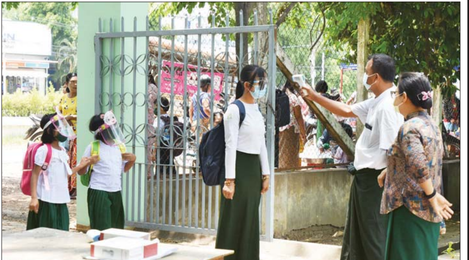
နေပြည်တော် အလက(၃)၌ ကျောင်းသား ကျောင်းသူများကို ကိုယ်အပူချိန် တိုင်းပေးနေစဉ်။ သတင်းစဉ်