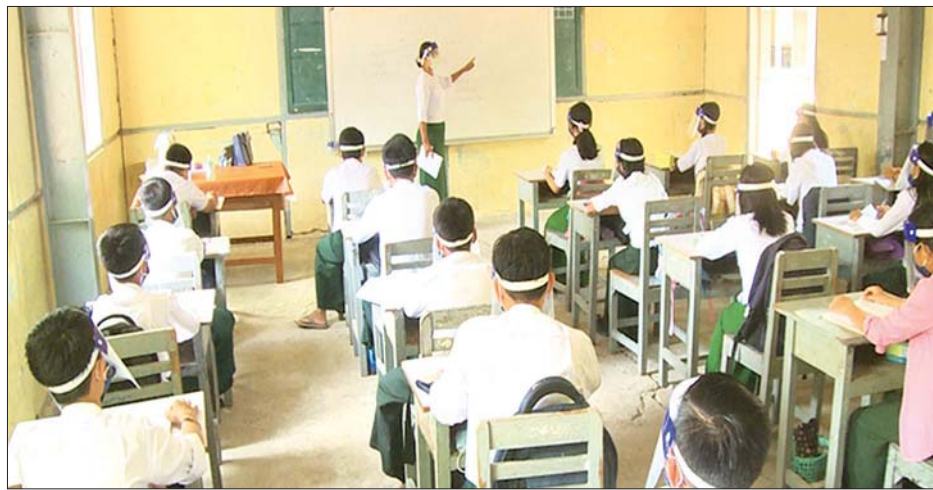
အောင်မြေသာစံမြို့နယ် အမှတ်(၁၈) အခြေခံပညာအထက်တန်းကျောင်း၌ ကျောင်းသား ကျောင်းသူများ ပညာသင်ကြားနေမှုကို တွေ့ရစဉ်။

တော့ ကလေးတွေရဲ့ ပညာရေးအဆက်မပြတ်စေဖို့ နိုင်ငံတော် စီမံအုပ်ချုပ်ရေးကောင်စီ၊ တိုင်းဒေသကြီး စီမံအုပ်ချုပ်ရေးကောင်စီတို့ရဲ့ လမ်းညွှန်မှုနဲ့အတူ ပညာရေးဝန်ကြီးဌာန အခြေခံပညာဦးစီးဌာနရဲ့ ညွှန်ကြားမှုတွေနဲ့အညီ ကျွန်တော်တို့ တိုင်းဒေသကြီး ပညာရေးမှူးရုံးက မန္တလေးတိုင်းအတွင်းမှာရှိတဲ့ ကလေးတွေအားလုံး ကျောင်းတွေကို ရောက်ရှိပညာသင်ကြားနိုင်ဖို့ ကြိုးစားဆောင်ရွက်လျက် ရှိပါတယ်။ ကျောင်း အသီးသီးမှာလည်း ကိုဗစ်-၁၉ ရောဂါ ကာကွယ် တားဆီးနိုင်ရေးအတွက် ကလေးအရွယ်အလိုက် Mask တွေ၊ Face Shield တွေ ဝတ်ဆင်နိုင်ဖို့နဲ့ ညွှန်ကြားချက်တွေအတိုင်း လိုက်နာပြီး သင်ကြားပေးနိုင်ဖို့ ဆောင်ရွက်ပေးလျက်ရှိပါတယ်။ ဒါ့အပြင် ကျောင်းတွေမှာ ကျောင်းသား ကျောင်းသူတွေ လုံခြုံမှုရှိစေဖို့အတွက် ကျောင်းသား ကျောင်းသူများ စောင့်ရှောက်ရေးအဖွဲ့တွေကို ဖွဲ့စည်းပြီး ပူးပေါင်းဆောင်ရွက်လျက်ရှိပါတယ်။ ဒါကြောင့် မိဘများအနေနဲ့ ကျောင်းမအပ်ရသေးတဲ့ မိမိတို့သားသမီးများကို ကျောင်းအပ်နှံပေးပြီး ပညာသင်ကြားနိုင်ဖို့အတွက် အလေးထားဆောင်ရွက်ပေးကြဖို့ တိုက်တွန်းလိုပါတယ်”ဟု ၎င်းက ပြောသည်။ ယခုပညာသင်နှစ်တွင် အခြေခံပညာကျောင်းများ ဖွင့်လှစ်ရာ၌