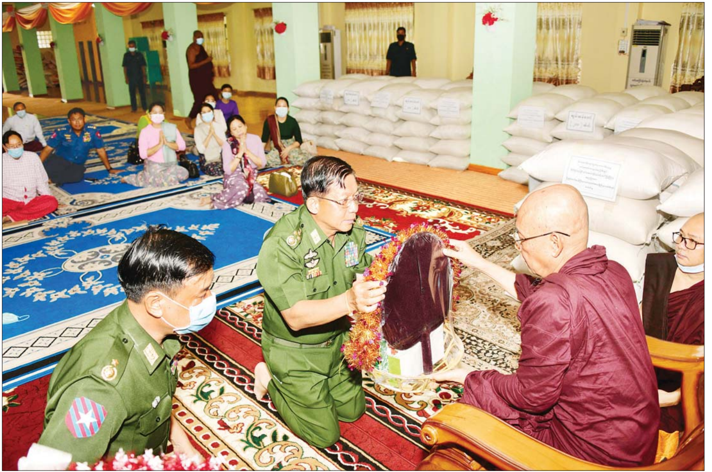
နိုင်ငံတော်စီမံအုပ်ချုပ်ရေးကောင်စီ ဥက္ကဋ္ဌ၊ တပ်မတော်ကာကွယ်ရေးဦးစီးချုပ် ဗိုလ်ချုပ်မှူးကြီး မင်းအောင်လှိုင် မော်လမြိုင်မြို့ မောင်ငံရပ်ရှိ မြစေတီပရိယတ္တိ စာသင်တိုက်ဦးစီးပဓာန နာယက ဆရာတော် ဓမ္မာစရိယ ဝိနယ ပါဠိ ပါရဂူ အဂ္ဂမဟာပဏ္ဍိတ ဘဒ္ဒန္တ ဝိမလဗုဒ္ဓိ ထံ လှူဖွယ်ပစ္စည်းများ ဆက်ကပ်လှူဒါန်းစဉ်။

ထို့နောက် နိုင်ငံတော်စီမံအုပ်ချုပ်ရေးကောင်စီ ဥက္ကဋ္ဌ၊ တပ်မတော်ကာကွယ်ရေးဦးစီးချုပ်နှင့် အဖွဲ့ဝင် များသည် ရွှေတံတောင်တပ်နယ် ဘောလုံး အားကစားကွင်း အဆင့်မြှင့်တင်တည်ဆောက်ရန် ဆောင်ရွက်နေမှုအခြေအနေများကို သွားရောက် ကြည့်ရှုပြီး တာဝန်ရှိသူများ၏ တင်ပြချက်များ အပေါ် အဆင့်မြှင့်တင်မှုလုပ်ငန်းများ ဆောင်ရွက်ရာ တွင် အရည်အသွေးပြည့်မီပြီး သတ်မှတ်စံချိန်စံညွှန်း များနှင့် ကိုက်ညီစေရေး အလေးထားလုပ်ဆောင်သွား ရန်နှင့် အနာဂတ်တွင် ကျင်းပပြုလုပ်လာနိုင်သည့် အားကစားပွဲ၊ ချစ်ကြည်ရေးပွဲများကို ရည်မှန်း၍ မြေနေရာအသုံးချမှုများအား စနစ်တကျ တွက်ချက် ကာ အကျိုးရှိရှိအသုံးပြုသွားရန် လိုအပ်သည့် အခြေ အနေများကို ပြန်လည်ဆွေးနွေးမှာကြားခဲ့ကြောင်း သတင်းရရှိသည်။