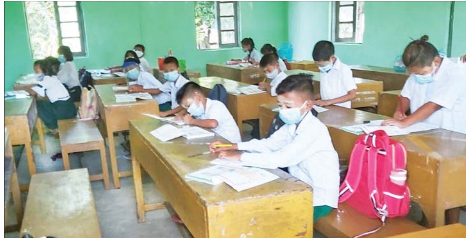
လှိုင်သာယာမြို့နယ်၌ ကျောင်းသား ကျောင်းသူများ ပညာသင်ကြားနေမှုကို တွေ့ရစဉ်။

ရန်ကုန် ဇွန် ၂ ရန်ကုန်တိုင်း ဒေသကြီးတွင် အခြေခံပညာကျောင်းနှင့် ကျောင်းသားအများဆုံးတည်ရှိရာ လှိုင်သာယာမြို့နယ်၌ ကျောင်းဖွင့်ရာသီ ဇွန် ၁ ရက်မှစ၍ ကျောင်းသား ကျောင်းသူ ၁၀၀၀၀ ကျော် တက်ရောက်ပညာသင်ကြားလျက်ရှိသည်။ လှိုင်သာယာ အရှေ့ပိုင်းမြို့နယ်တွင် မူလတန်း ၃၄၉၁ ဦး၊ အလယ်တန်း ၁၈၈၄ ဦးနှင့် အထက်တန်း ၃၈၂ ဦးဖြင့် စုစုပေါင်း ၅၇၅၇ ဦး တက်ရောက်သင်ကြားလျက်ရှိပြီး လှိုင်သာယာ အနောက်ပိုင်းမြို့နယ်၌ မူလတန်း ၃၃၁၅ ဦး၊ အလယ်တန်း ၁၈၈၇ ဦးနှင့် အထက်တန်း ၅၄၄ ဦးဖြင့် စုစုပေါင်း ၅၇၄၇ ဦး တက်ရောက်သင်ကြားလျက်ရှိရာ မြို့နယ်တစ်ခုလုံးတွင် ကျောင်းသား/ကျောင်းသူ ၂၂၅၂၂ ဦး အပ်နှံ၍ ၁၁၄၉၄ ဦး တက်ရောက်သင်ကြားလျက်ရှိသည်။ “တစ်မြို့နယ်လုံး အတိုင်း