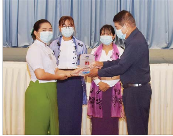
ဌာနမှူးများ၊ သင်တန်းနည်းပြ သင်တန်းသူများ တက်ရောက်ခဲ့ ဆရာများ၊ သင်တန်းသား ကြောင်း သိရသည်။ သတင်းစဉ်

ရန်ကုန် ဇွန် ၂ ရန်ကုန်မြို့တော် စည်ပင်သာယာရေးကော်မတီ e-Government Applied Training အမှတ်စဉ် (၁၁) သင်တန်းဆင်းပွဲ အခမ်းအနားကို ယနေ့နံနက် ၈ နာရီက ရန်ကုန်မြို့တော်ခန်းမ ပထမထပ်ရှိ အစည်းအဝေးခန်းမကြီး၌ ကျင်းပရာ ရန်ကုန်မြို့တော် စည်ပင်သာယာရေး ကော်မတီ ဥက္ကဋ္ဌ(မြို့တော်ဝန်) ဦးဗိုလ်ဌေး တက်ရောက်၍ အဖွင့်အမှာစကား ပြောကြားသည်။ ထို့နောက် မြို့တော်ဝန်က သင်တန်းတွင် ထူးချွန်ဆုရရှိသူများနှင့် သင်တန်းဆင်း အောင်လက်မှတ်များ ပေးအပ်ချီးမြှင့်သည်။ အဆိုပါ သင်တန်းတွင် ရန်ကုန်မြို့တော် စည်ပင်သာယာရေးကော်မတီနှင့် တိုင်းဒေသကြီး စည်ပင်သာယာရေးအဖွဲ့မှ သင်တန်းသား ၂၂ ဦး တက်ရောက်ပြီး သင်တန်းကာလမှာ ရက်သတ္တခြောက်ပတ်ကြာမြင့်ခဲ့ကြောင်း သိရသည်။ အဆိုပါ သင်တန်းဆင်းပွဲ အခမ်းအနားသို့ ရန်ကုန်မြို့တော် စည်ပင်သာယာရေး ကော်မတီ ဒုတိယဥက္ကဋ္ဌ(ဒုတိယမြို့တော်ဝန်) ဦးညီညီနှင့် ကော်မတီဝင်များ၊