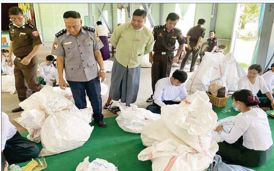
မိုင်းပန်မြို့နယ် ဆန္ဒမဲလက်မှတ် မြေပြင်စစ်ဆေးမှု မှတ်တမ်းဓာတ်ပုံ။