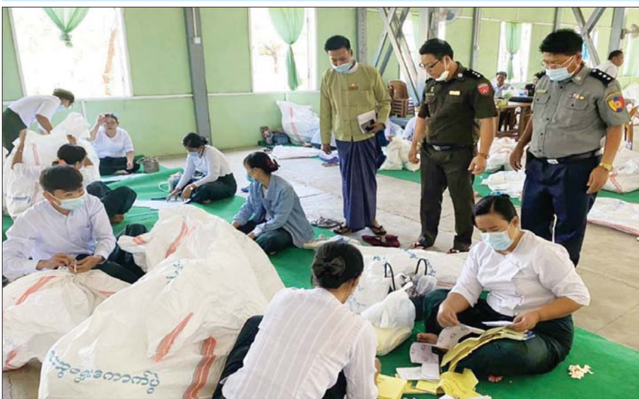
မောက်မယ်မြို့နယ် ဆန္ဒမဲလက်မှတ် မြေပြင်စစ်ဆေးမှု မှတ်တမ်းဓာတ်ပုံ။