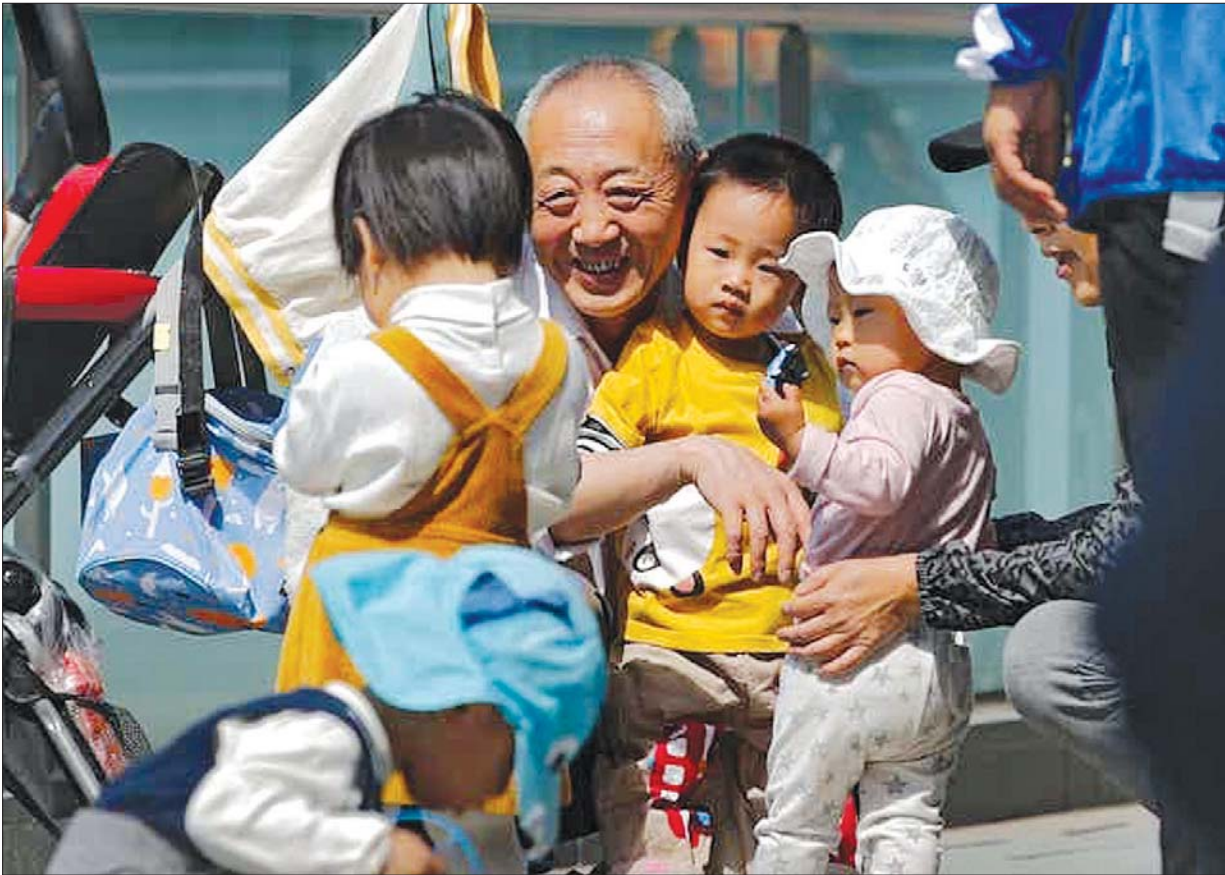
ပေကျင်းတွင် အဘိုးအိုတစ်ဦး ကလေးများနှင့်အတူပျော်ရွှင်စွာနေနေသည်ကို တွေ့ရစဉ်။

ဒီကြေညာချက်ဟာ တရုတ်လူမှုမီဒီယာ ပလက်ဖောင်းဖြစ်တဲ့ ဝီဘိုမှာ လှောင်ပြောင်မှုတွေနဲ့ ကြုံတွေ့ခဲ့ပါတယ်။ အလုပ်ချိန်အကြာ ကြီးလုပ်ရတာတွေ၊ မိုးထိုးနေတဲ့ အိမ်ခြေတွေ၊ သက်ကြီးဆွေမျိုးတွေကို ထောက်ပံ့ပေးဖို့အတွက် မြင့်တက်လာတဲ့ ဝန်ထုပ်ဝန်ပိုးတွေဟာ