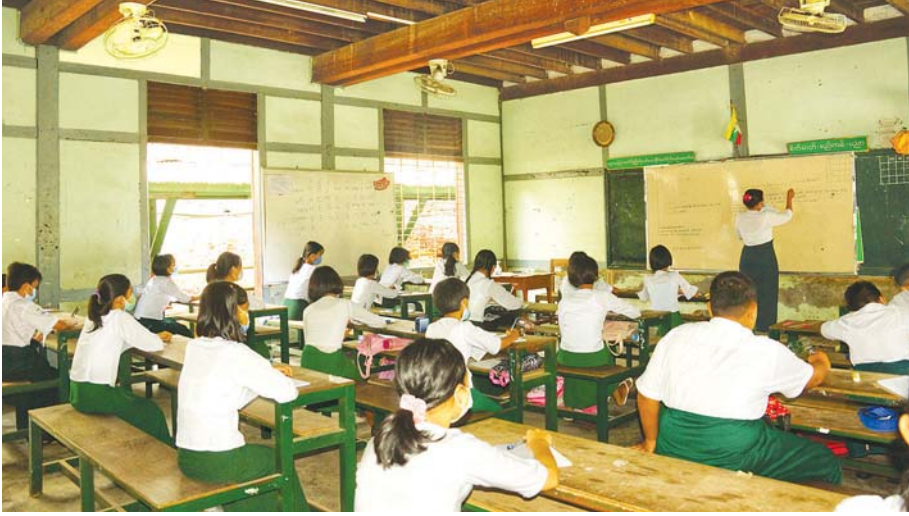
ချမ်းအေးသာစံမြို့နယ်တွင် ကျောင်းသား ကျောင်းသူများ ပညာသင်ကြားနေမှုကို တွေ့ရစဉ်။ တင်လင်းထက်(ပြန်/ဆက်)

၂၀၂၁ ခုနှစ် ဇွန် ၁ ရက်တွင် နိုင်ငံတစ်ဝန်းရှိ အခြေခံပညာ (အထက်တန်း၊ အလယ်တန်း၊ မူလတန်း) ကျောင်းများကို စတင်ဖွင့်လှစ်ရာ ဇွန် ၂ ရက်တွင် မြို့နယ်အချို့၌ ကျောင်းသား ကျောင်းသူများ လာရောက် ကျောင်းတက်မှုနှင့် ပညာသင်ကြားနေမှုမြင်ကွင်းများကို စုစည်းဖော်ပြအပ်ပါသည်။