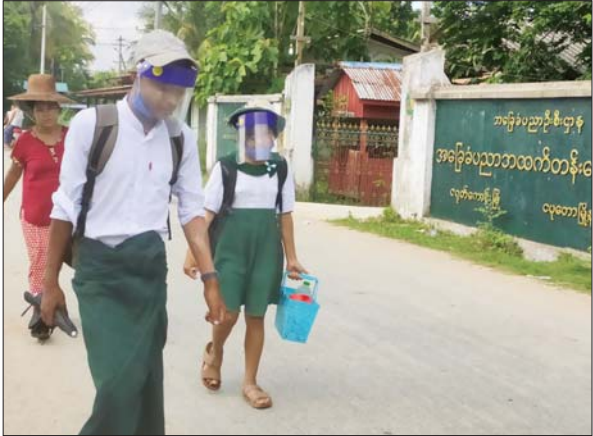
ငရုတ်ကောင်းမြို့နယ်၌ ကျောင်းတက်လာသည့် ကျောင်းသား ကျောင်းသူများကို တွေ့ရစဉ်။ ငရုတ်ကောင်း(ပြန်/ဆက်)