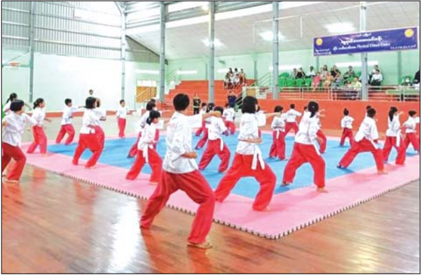
သင်တန်းဆင်းကျောင်းသားများက အခြေခံ မြန်မာ့သိုင်းပညာစဉ်ဖြင့် သရုပ်ပြသစဉ်။