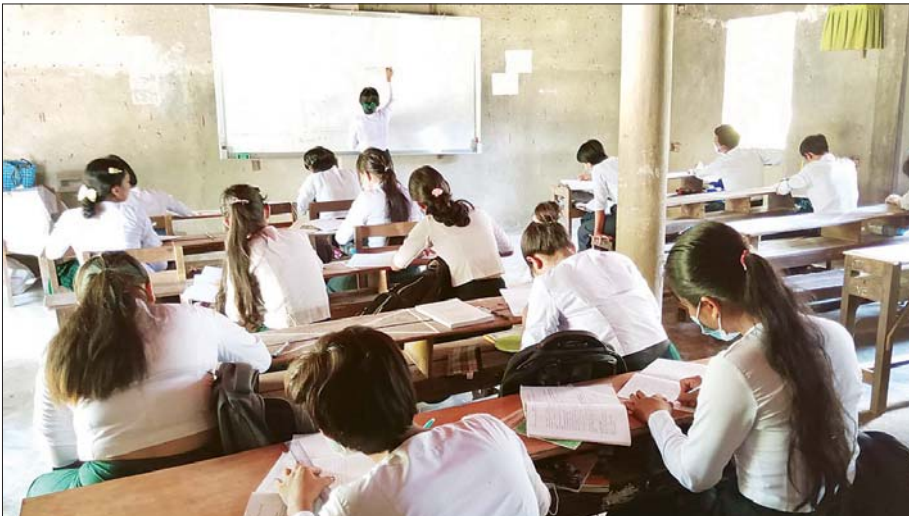
ထားဝယ်မြို့နယ်တွင် ကျောင်းသား ကျောင်းသူများ ပညာသင်ကြားနေမှုကို တွေ့ရစဉ်။ ခရိုင်(ပြန်/ဆက်)