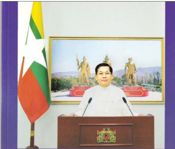
နိုင်ငံတော်စီမံအုပ်ချုပ်ရေးကောင်စီ ဥက္ကဋ္ဌ တပ်မတော်ကာကွယ်ရေးဦးစီးချုပ် ဗိုလ်ချုပ်မှူးကြီးမင်းအောင်လှိုင် ပြောကြားခဲ့သည့် မိန့်ခွန်းများ (၂၀၂၁ ခုနှစ်၊ ဧပြီလ)