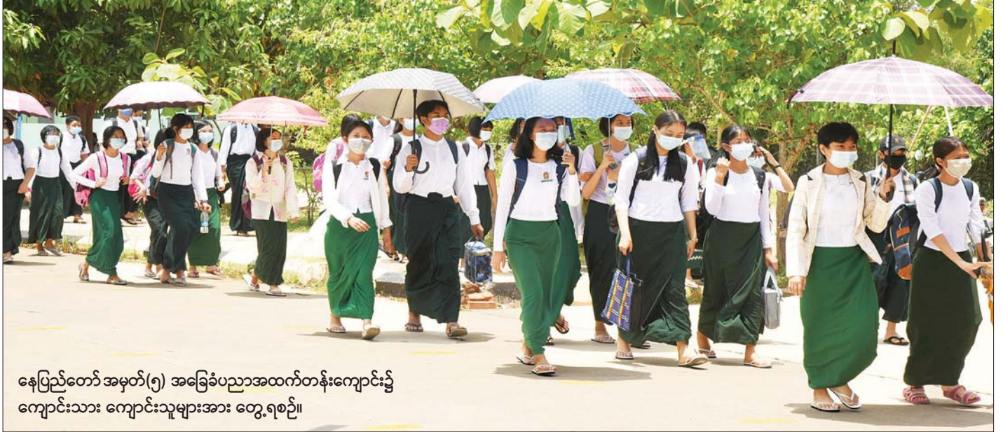
နေပြည်တော် အမှတ်(၅) အခြေခံပညာအထက်တန်းကျောင်း၌ ကျောင်းသား ကျောင်းသူများအား တွေ့ရစဉ်။

နေပြည်တော် အမှတ် (၅) အခြေခံပညာအထက်တန်းကျောင်းအုပ်ကြီးက “ ဒီနေ့က ကျောင်းစတင်ဖွင့်လှစ်တဲ့နေ့ဖြစ်တဲ့အတွက် ကျောင်းသား ကျောင်းသူတွေ သက်ဆိုင်ရာအတန်းကို ဝင်ရောက်နိုင်ဖို့ ဆရာဆရာမတွေက နေရာချထားပေးပါတယ်။ ဒီနှစ် စာသင်ကြားရေးအပိုင်းအနေနဲ့ နံနက်ပိုင်းတစ်သက်တန်း