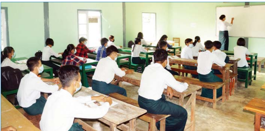
နေပြည်တော် ဒက္ခိဏသီရိမြို့နယ်တွင် ကျောင်းသား ကျောင်းသူများ ပညာသင်ကြားနေမှုကို တွေ့ရစဉ်။ ခရိုင်(ပြန်/ဆက်)