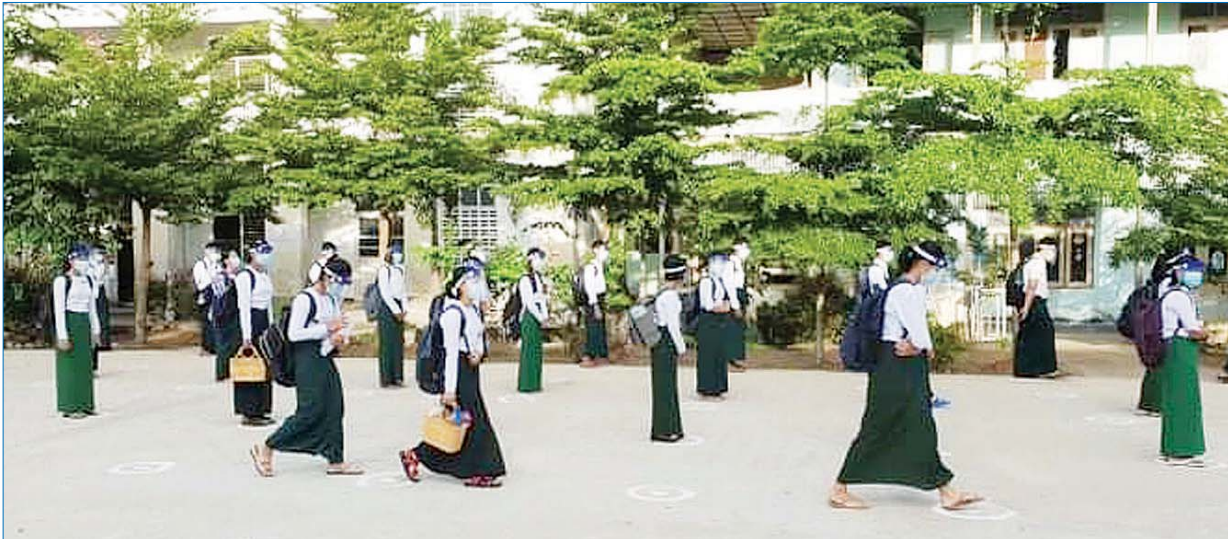
မြဝတီမြို့၌ ကျောင်းသား ကျောင်းသူများ အေးချမ်းစွာ ကျောင်းတက်နေကြသည်ကို တွေ့ရစဉ်။ ထိန်လင်းအောင်(ပြန်/ဆက်)

၂၀၂၁ ခုနှစ် ဇွန် ၁ ရက်တွင် နိုင်ငံတစ်ဝန်းရှိ အခြေခံပညာ (အထက်တန်း၊ အလယ်တန်း၊ မူလတန်း) ကျောင်းများကို စတင်ဖွင့်လှစ်ရာ မြို့နယ်အချို့၌ ကျောင်းသား ကျောင်းသူများ လာရောက်ကျောင်းတက်မှုနှင့် ပညာသင်ကြားနေမှုမြင်ကွင်းများကို စုစည်းဖော်ပြအပ်ပါသည်။