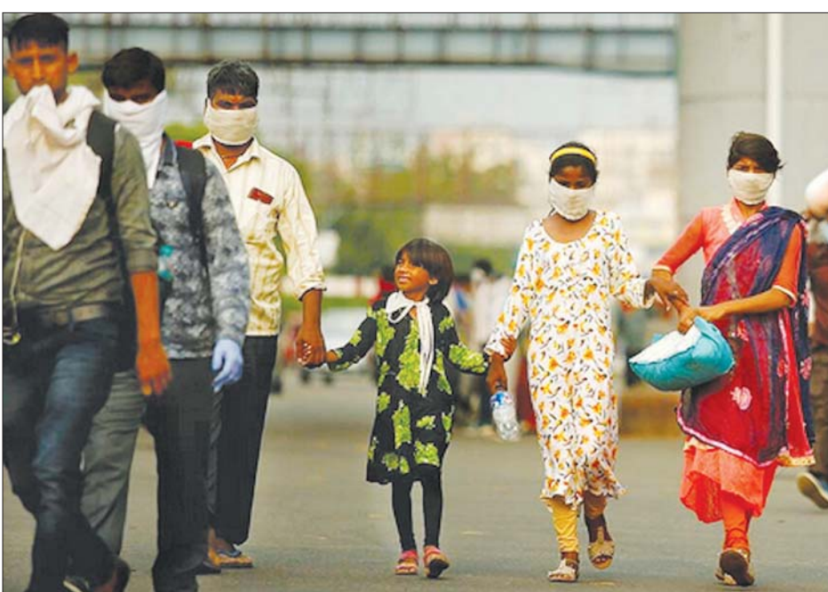
နယူးဒေလီသို့ပြန်လာကြသည့် ရွှေ့ပြောင်းလုပ်သားများကို တွေ့ရစဉ်။

အိန္ဒိယနိုင်ငံ၏ စီးပွားရေးသည် ပြီးခဲ့သည့်နှစ် မတ်လမှစတင်ကာ ကိုဗစ် - ၁၉ ကန့်သတ်ချက်များ ကြောင့် စီးပွားရေးကျဆင်းသွား သည်ဟုသိရသည်။ လွန်ခဲ့သည့် နှစ်များကနှင့် နှိုင်းယှဉ်လျှင် ၂၀၂၀ ဘဏ္ဍာနှစ်အတွက် တိုင်းပြည် ဂျီဒီပီ ၇ ဒသမ ၃ ရာခိုင်နှုန်းမှာ ကျဆင်းသည်ဟု အစိုးရက ဇွန် ၁ ရက်တွင် ပြောသည်။