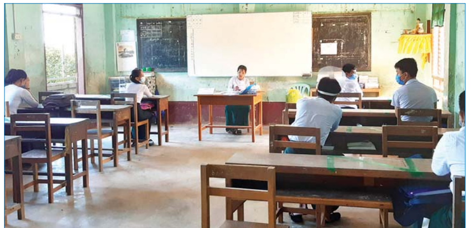
ကော့သောင်းမြို့၌ ကျောင်းသား ကျောင်းသူများ ပညာသင်ကြားနေမှုကို တွေ့ရစဉ်။ ကျော်စိုး(ကော့သောင်း)