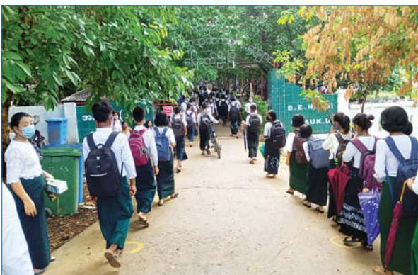
မြောက်ဦးမြို့ အ.ထ.က (၁) ၌ ကျောင်းတက်လာကြသည့် ကျောင်းသား ကျောင်းသူများကို တွေ့ရစဉ်။ မြို့နယ်(ပြန်/ဆက်)