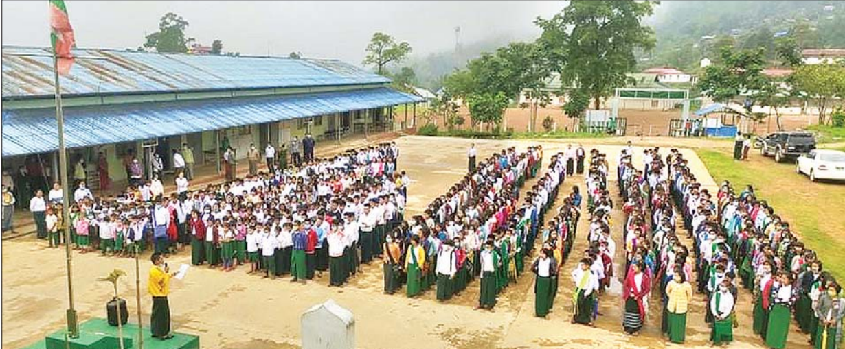
နာကကိုယ်ပိုင်အုပ်ချုပ်ခွင့်ရဒေသ လဟယ်မြို့တွင် ကျောင်းသား ကျောင်းသူများ နိုင်ငံတော်အလံကို အလေးပြုရန် တန်းစီနေကြစဉ်။ ရှားဆက်(လဟယ်)