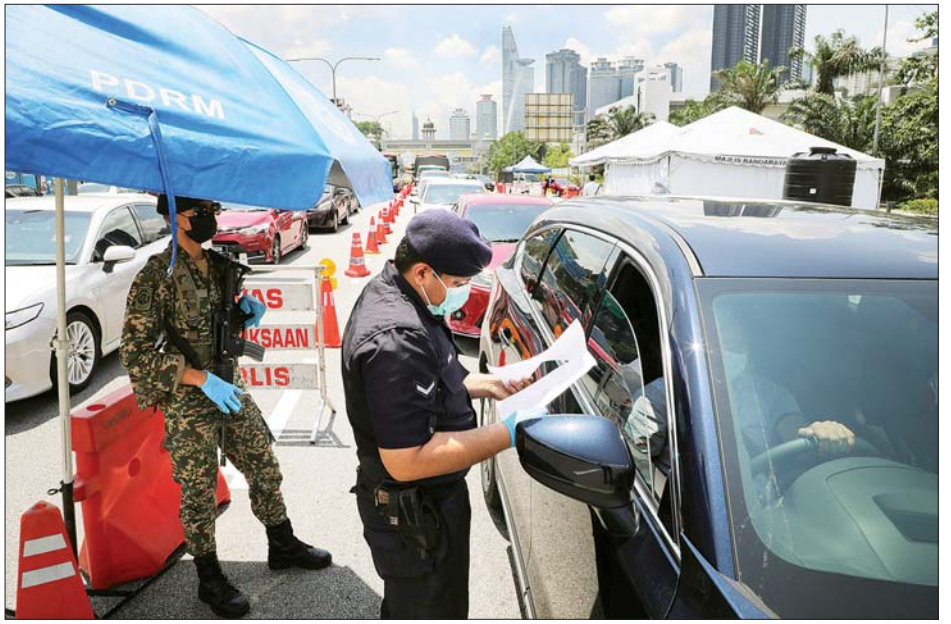
ယာယီစစ်ဆေးရေးဂိတ်တစ်ခုတွင် သက်ဆိုင်ရာတာဝန်ရှိသူများက စစ်ဆေးမှုများ ပြုလုပ်နေစဉ်။

မြို့တော်ကွာလာလမ်ပူတွင် အဓိကဈေးဝယ်နေရာများကို ပိတ်ထားသည်။ လူအနည်းငယ်ကိုသာ လမ်းမပေါ်တွင် တွေ့မြင်နိုင်သည်။ ရဲဝန်ထမ်းများသည် ယာယီစစ်ဆေးရေးဂိတ်များတွင် ယာဉ်များကို ရပ်တန့်၍ ယာဉ်မောင်းများကို ဘာကြောင့် အပြင်ထွက်လာသလဲဆိုပြီး မေးမြန်းစစ်ဆေးလျက်ရှိသည်။ ထိုသို့ လုပ်ဆောင်ချက်များသည် ကိုဗစ်-၁၉ ကူးစက်ဖြစ်ပွားမှုကို လျော့ချရာတွင် ကူညီသွားမည်ဟု ဘဏ်ဝန်ထမ်းတစ်ဦးက ပြောသည်။ ကိုဗစ်-၁၉ ကူးစက်ဖြစ်ပွားမှုများကို မကြာမီ ထိန်းချုပ်သွားနိုင်ရန် ၎င်းက မျှော်လင့်လျက်ရှိသည်။