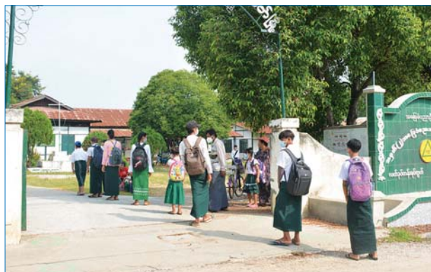
မိုးမိတ်မြို့ အ.ထ.က (၂) တွင် ကျောင်းတက်လာကြသည့် ကျောင်းသား ကျောင်းသူများကို တွေ့ရစဉ်။ မိုးမိတ်သား(စည်သူဌေး)