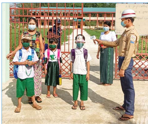
ကျောင်းကုန်းမြို့တွင် ကျောင်းသား ကျောင်းသူလေးများအား ကိုယ်အပူချိန်တိုင်းတာပေးနေမှုကို တွေ့ရစဉ်။ ဝင်းကြိုင်(ပြန်/ဆက်)