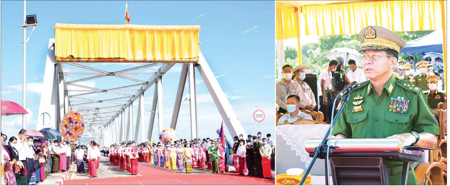
နိုင်ငံတော်စီမံအုပ်ချုပ်ရေးကောင်စီ ဥက္ကဋ္ဌ၊ တပ်မတော်ကာကွယ်ရေးဦးစီးချုပ် ဗိုလ်ချုပ်မှူးကြီး မင်းအောင်လှိုင် သံလွင်တံတား (ချောင်းဆုံ) ဆိုင်းဘုတ်ဖွင့်လှစ်ခြင်းအခမ်းအနားတွင် အမှာစကားပြောကြားစဉ်။