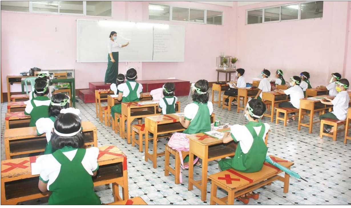
ရန်ကုန်မြို့၊ ကမာရွတ်မြို့နယ် လေ့ကျင့်ရေးအထက်တန်းကျောင်း၌ ကျောင်းသား ကျောင်းသူများ ပညာသင်ကြားနေမှုကို တွေ့ရစဉ်။

ရန်ကုန် ဇွန် ၁ ကိုဗစ်-၁၉ ကူးစက်ကပ်ရောဂါကြောင့် မြန်မာနိုင်ငံရှိ အခြေခံပညာ ကျောင်းများကို ၂၀၂၀-၂၀၂၁ ပညာသင်နှစ်တွင် ပညာသင်ကြားမှုများ ရပ်နားခဲ့ရာမှ ၂၀၂၁-၂၀၂၂ ပညာသင်နှစ်အတွက် အခြေခံပညာ အဆင့် ကျောင်းများကို နိုင်ငံတော်က ယနေ့ ပြန်လည်ဖွင့်လှစ် ခဲ့ရာ ကျောင်းသား ကျောင်းသူများ စတင်ပညာသင်ကြားလျက် ရှိသည်။