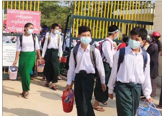
နေပြည်တော် မြို့နယ်ရှိ ကျောင်းတက်လာကြသည့် ကျောင်းသား ကျောင်းသူများကို တွေ့ရစဉ်။ မောင်ယဉ်ဦး