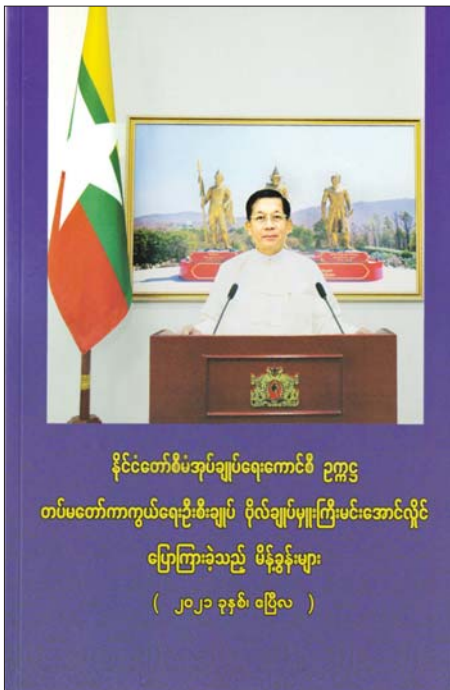
နိုင်ငံတော်စီမံအုပ်ချုပ်ရေးကောင်စီ ဥက္ကဋ္ဌ တပ်မတော်ကာကွယ်ရေးဦးစီးချုပ် ဗိုလ်ချုပ်မှူးကြီးမင်းအောင်လှိုင် ပြောကြားခဲ့သည့် မိန့်ခွန်းများ ( ၂၀၂၀ ခုနှစ်၊ ဧပြီလ )

လုပ်ဆောင်သွားမည်ဖြစ်ကြောင်း။ မိမိတို့နိုင်ငံအနေဖြင့် ဒီမိုကရေစီနှင့် ဖက်ဒရယ်စနစ်ကို ဆက်လက်အကောင်အထည်ဖော်ဆောင်ရွက်သွားရမည်ဖြစ်ကြောင်း၊ သို့ဖြစ်၍ ပြည်သူလူထုအား ဒီမိုကရေစီအသိအမြင်နှင့် ဖက်ဒရယ်အသိအမြင်ရှိအောင် တာဝန်ရှိသူများအနေဖြင့် ရှင်းလင်းပြောကြားရမည်ဖြစ်ကြောင်း၊ ဒို့တာဝန်အရေးသုံးပါးကို ထိခိုက်ခံ၍မရကြောင်း၊ ဖွံ့ဖြိုးတိုးတက်ရေး၊ တည်ငြိမ်အေးချမ်းရေး၊ တရားဥပဒေစိုးမိုးရေး၊ ဒီမိုကရေစီနှင့် ဖက်ဒရယ်စနစ်အသိအမြင်ရှိရေးတို့ကို မိမိတို့တာဝန်ယူသည့်ကာလအတွင်း ဆောင်ရွက်နိုင်မှသာ မှတ်ကျောက်တင်ခံရမည့် အစိုးရတစ်ရပ်ဖြစ်လာမည်ဖြစ်ကြောင်း” ပြောကြားသည့် အမှာစကားအပါအဝင် နိုင်ငံတော်စီမံအုပ်ချုပ်ရေးကောင်စီဥက္ကဋ္ဌ၊ တပ်မတော်ကာကွယ်ရေးဦးစီးချုပ်၏ မိန့်ခွန်း