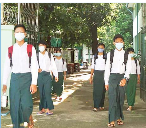
ဗမာန်းမြို့နယ် အ.ထ.က(၃)တွင် ကျောင်းတက်လာကြသည့် ကျောင်းသား ကျောင်းသူများကို တွေ့ရစဉ်။ အာကာစိုး