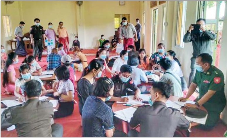
ဇွန် ၁ ရက်က နေပြည်တော် ဥက္ကဋ္ဌရသီရိတပ်နယ်အတွင်းရှိ တပ်ရင်းတပ်ဖွဲ့များမှ အရာရှိ/စစ်သည်မိသားစုဝင်များကို ပန်းခင်းစီမံချက်ဖြင့် အိမ်ထောင်စုလူဦးရေစာရင်းနှင့် နိုင်ငံသားစိစစ်ရေးကတ်ပြားများ ဆောင်ရွက်ပေးရာ နေပြည်တော် လူဝင်မှု ကြီးကြပ်ရေးနှင့် ပြည်သူ့အင်အားဆိုင်ရာ ပြည်ထောင်စုနယ်မြေ ဦးစီးမှူး ညွှန်ကြားရေးမှူး ဦးကျော်သိန်းဆိုင်နှင့် အဖွဲ့ဝင်များက ကြည့်ရှုစစ်ဆေးစဉ်။ အောင်ကို(ပြန်/ဆက်)