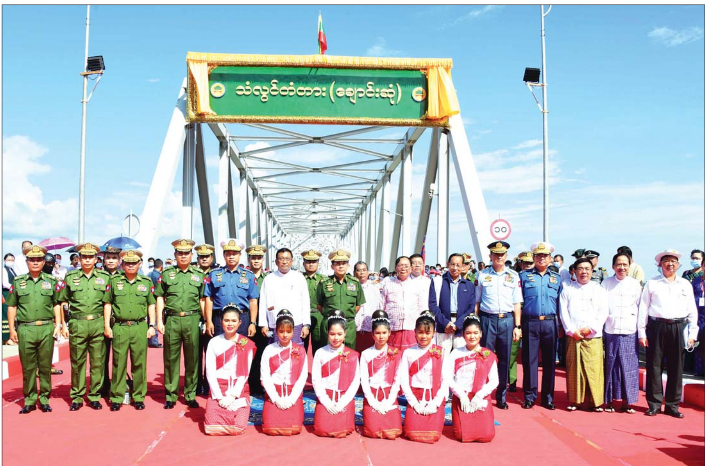
နိုင်ငံတော်စီမံအုပ်ချုပ်ရေးကောင်စီ ဥက္ကဋ္ဌ၊ တပ်မတော်ကာကွယ်ရေးဦးစီးချုပ် ဗိုလ်ချုပ်မှူးကြီး မင်းအောင်လှိုင် ကောင်စီဝင်များ၊ ပြည်ထောင်စုဝန်ကြီးများ၊ တာဝန်ရှိသူများနှင့် စုပေါင်းမှတ်တမ်းတင်ဓာတ်ပုံရိုက်စဉ်။

ဆက်လက်၍ နိုင်ငံတော်စီမံအုပ်ချုပ်ရေး ကောင်စီဥက္ကဋ္ဌ၊ တပ်မတော်ကာကွယ်ရေးဦးစီးချုပ် နှင့် အဖွဲ့ဝင်များသည် တံတားကြီးပေါ်မှ ဖြတ်သန်း ကြည့်ရှုစစ်ဆေးကြပြီး တံတားကြီးအား ရေရှည် တည်တံ့ခိုင်မြဲအောင် ထိန်းသိမ်းစောင့်ရှောက်ရန် လိုအပ်သည်များကို မှာကြားသည်။ ထို့နောက်