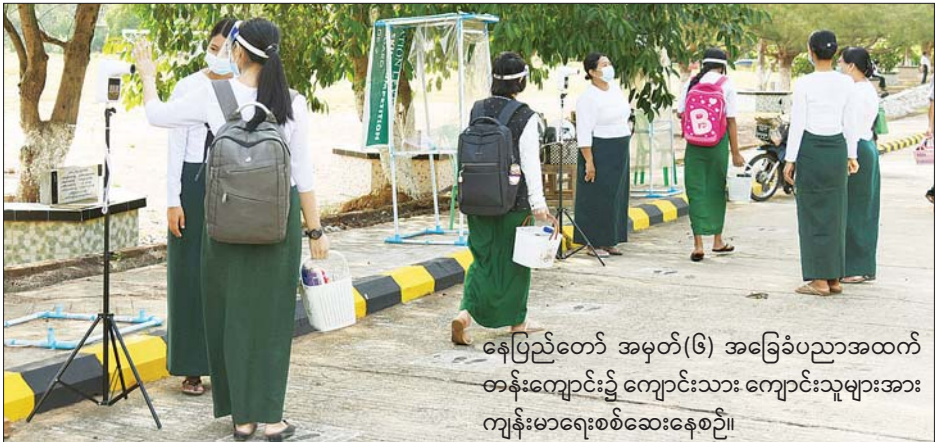
နေပြည်တော် အမှတ်(၆) အခြေခံပညာအထက်တန်းကျောင်း၌ ကျောင်းသား ကျောင်းသူများအား ကျန်းမာရေးစစ်ဆေးနေစဉ်။