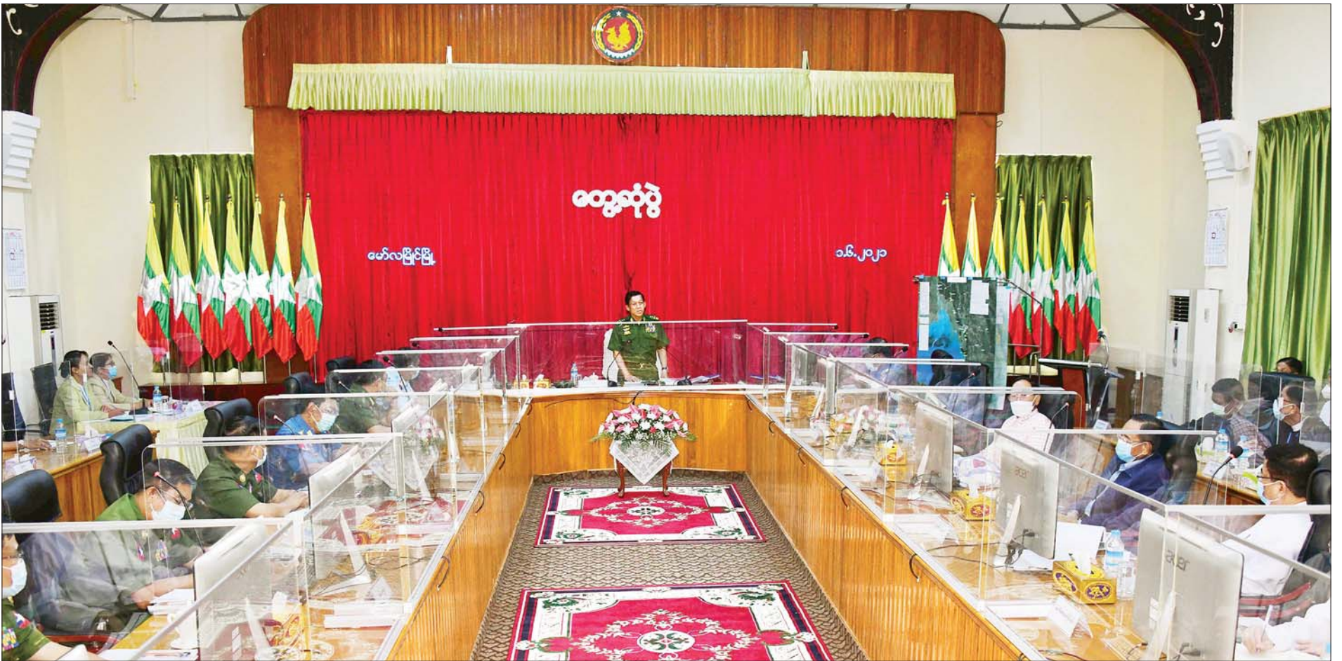
နိုင်ငံတော်စီမံအုပ်ချုပ်ရေးကောင်စီဥက္ကဋ္ဌ၊ တပ်မတော်ကာကွယ်ရေးဦးစီးချုပ် ဗိုလ်ချုပ်မှူးကြီးမင်းအောင်လှိုင် မွန်ပြည်နယ်စီမံအုပ်ချုပ်ရေးကောင်စီအဖွဲ့ဝင်များနှင့် ဌာနဆိုင်ရာဝန်ထမ်းများအား တွေ့ဆုံပွဲတွင် အမှာစကားပြောကြားစဉ်။