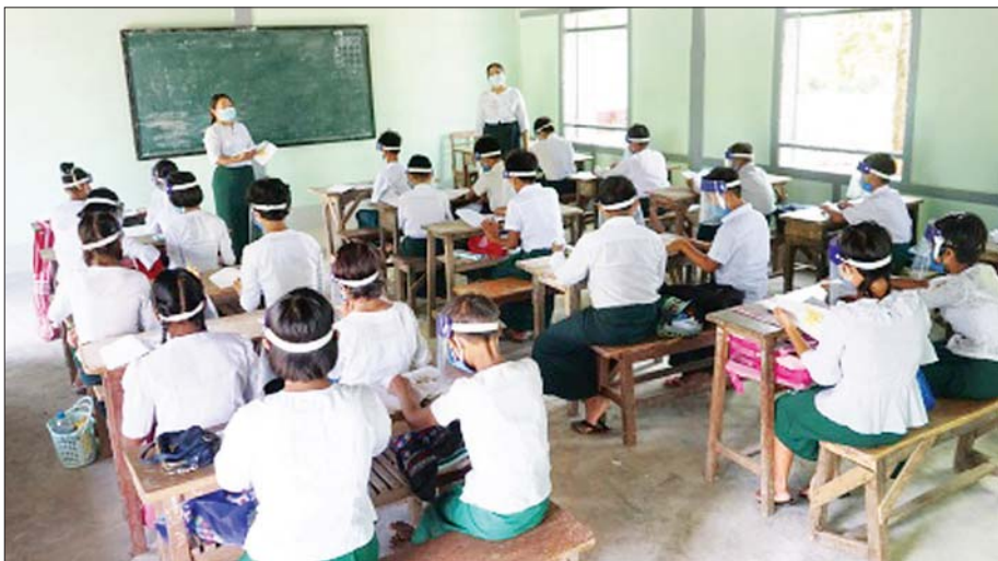
မြစ်သားမြို့နယ်၌ ကျောင်းသား ကျောင်းသူများ ပညာသင်ကြားနေမှုကို တွေ့ရစဉ်။ မြမြမွန်(ပြန်/ဆက်)