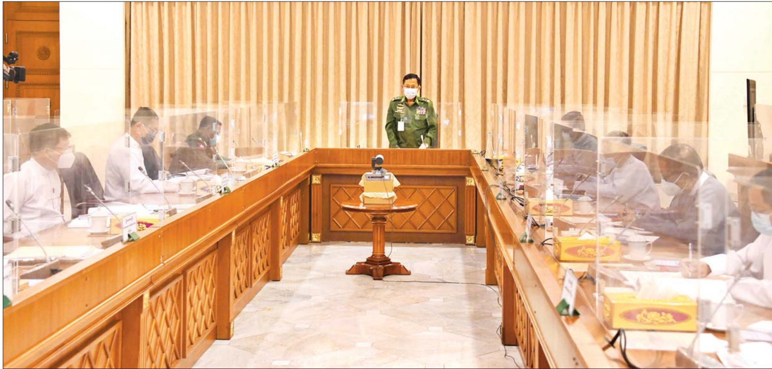
နိုင်ငံတော်စီမံအုပ်ချုပ်ရေးကောင်စီဒုတိယဥက္ကဋ္ဌ ဒုတိယတပ်မတော်ကာကွယ်ရေးဦးစီးချုပ်၊ ကာကွယ်ရေးဦးစီးချုပ် (ကြည်း) ဒုတိယဗိုလ်ချုပ်မှူးကြီး စိုးဝင်း မြန်မာအထူး စီးပွားရေးဇုန်ဆိုင်ရာ ဗဟိုအဖွဲ့အစည်းအဝေး (၁/၂၀၂၁) တွင် အမှာစကားပြောကြားစဉ်။

နေပြည်တော် ဇွန် ၁ မြန်မာအထူးစီးပွားရေးဇုန်ဆိုင်ရာ ဗဟိုအဖွဲ့အစည်းအဝေး (၁/၂၀၂၁) ကို ယနေ့မနက် ၂ နာရီတွင် နေပြည်တော်ရှိ နိုင်ငံတော်စီမံ အုပ်ချုပ်ရေးကောင်စီ ဒုတိယ ဥက္ကဋ္ဌရုံး အစည်းအဝေးခန်းမ၌ ကျင်းပရာ မြန်မာအထူးစီးပွားရေး ဇုန်ဆိုင်ရာ ဗဟိုအဖွဲ့ဥက္ကဋ္ဌ၊ နိုင်ငံတော် စီမံအုပ်ချုပ်ရေး ကောင်စီဒုတိယဥက္ကဋ္ဌ၊ ဒုတိယ တပ်မတော်ကာကွယ်ရေး ဦးစီး ချုပ်၊ ကာကွယ်ရေးဦးစီးချုပ် (ကြည်း) ဒုတိယဗိုလ်ချုပ်မှူးကြီး စိုးဝင်း တက်ရောက်အမှာစကား ပြောကြားသည်။ အစည်းအဝေးသို့ မြန်မာ အထူးစီးပွားရေးဇုန်ဆိုင်ရာ ဗဟို အဖွဲ့ဝင်များ ဖြစ်ကြသည့် စာမျက်နှာ ၁၀ ကော်လံ ၁ ၀