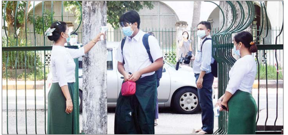
ကမာရွတ်မြို့နယ် လေ့ကျင့်ရေးအထက်တန်းကျောင်း၌ ကျောင်းသားတစ်ဦးအား ကိုဗစ်-၁၉ ကာကွယ်ရေး အတွက် အပူချိန်တိုင်းပေးနေစဉ်။