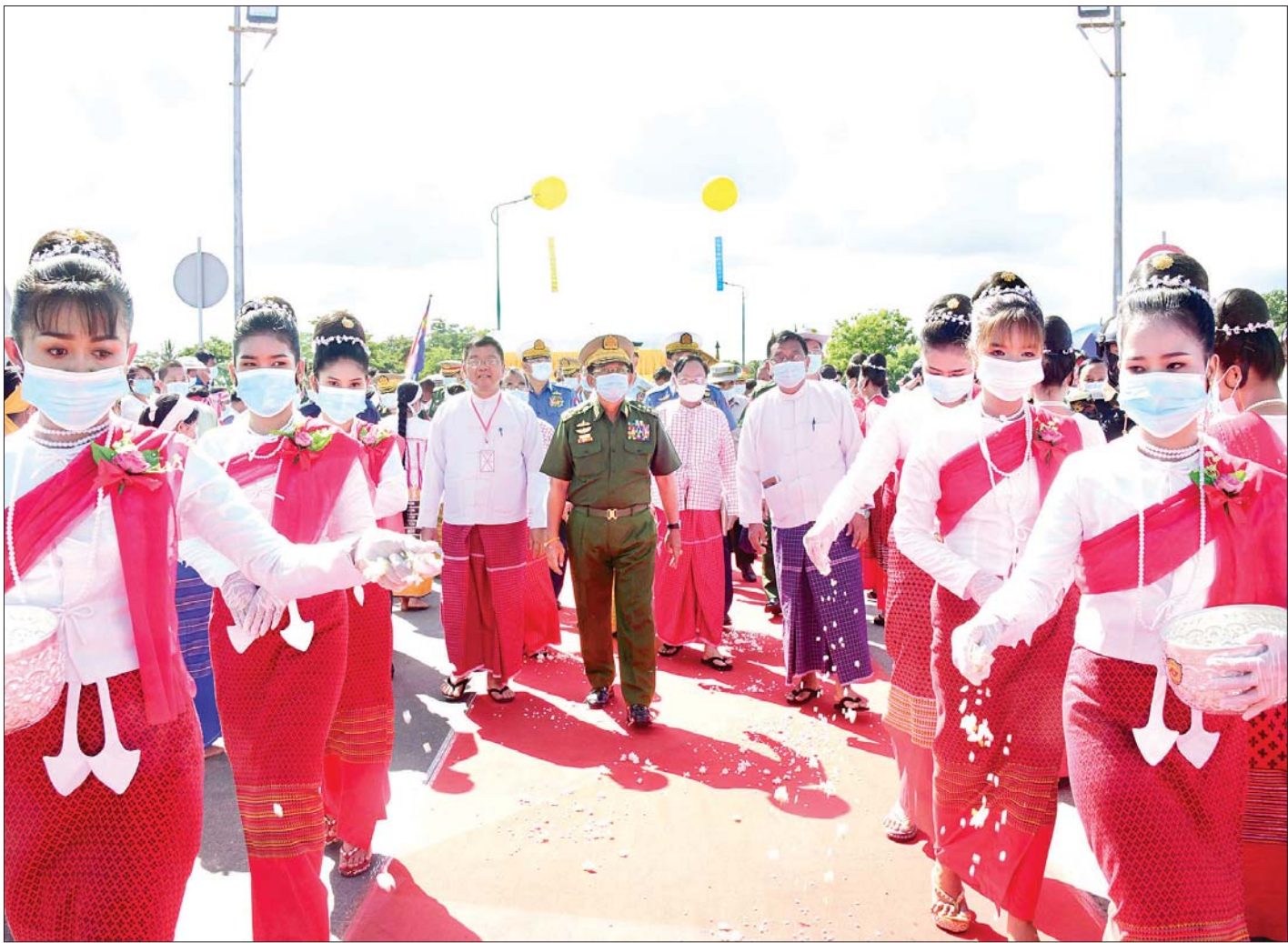
နိုင်ငံတော်စီမံအုပ်ချုပ်ရေးကောင်စီ ဥက္ကဋ္ဌ၊ တပ်မတော်ကာကွယ်ရေးဦးစီးချုပ် ဗိုလ်ချုပ်မှူးကြီး မင်းအောင်လှိုင်နှင့်အဖွဲ့ဝင်များ သံလွင်တံတား (ချောင်းဆုံ) ပေါ်မှ ဖြတ်သန်းကြည့်ရှုစစ်ဆေးစဉ်။

ဗိုလ်ချုပ်အောင်ဆန်းသည် မိမိတို့နိုင်ငံ၏ လွတ်လပ်ရေးဖခင် အမျိုးသားခေါင်းဆောင် ဖြစ် သကဲ့သို့ တပ်မတော်၏ဖခင်လည်း ဖြစ်ပါကြောင်း၊ မိမိတို့သည် မိမိတို့ လေးစားကြည်ညိုရသူများ၏ ပုံရိပ်ဆိုခြင်းထက် ၎င်းတို့၏လမ်းစဉ်၊ ၎င်းတို့၏စကား များကို ပို၍အလေးထား လိုက်နာဆောင်ရွက်ခြင်း သည် ၎င်းတို့၏ ဂုဏ်ကို မြှင့်တင်ရာရောက်မည် ဖြစ်ပါကြောင်း၊ ဗိုလ်ချုပ်အောင်ဆန်းဆိုသည့် အမည်သည် မြန်မာ့လွတ်လပ်ရေးသမိုင်းတွင် အထင်ကရတည်တံ့နေမည့်အမည်ဖြစ်သကဲ့သို့ ယခု တံတားအမည် ပြောင်းလဲသတ်မှတ်မှုသည်လည်း ဗိုလ်ချုပ်အောင်ဆန်း လိုလားတောင့်တခဲ့သည့် တိုင်းရင်းသားများအချင်းချင်း ချစ်ကြည်ရင်းနှီးမှု ရှိစေရေးကို ခိုင်ခိုင်မာမာဖြစ်စေမည် ဖြစ်ပါကြောင်း၊ ဒေသခံပြည်သူလူထုအနေဖြင့် မလိုလားသော်လည်း