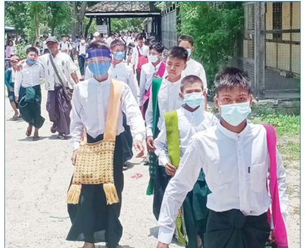
ရမည်းသင်း အ.ထ.က (၁) တွင် ကျောင်းဆင်းလာကြသည့် ကျောင်းသားများကို တွေ့ရစဉ်။ မောင်စိန်လွင်