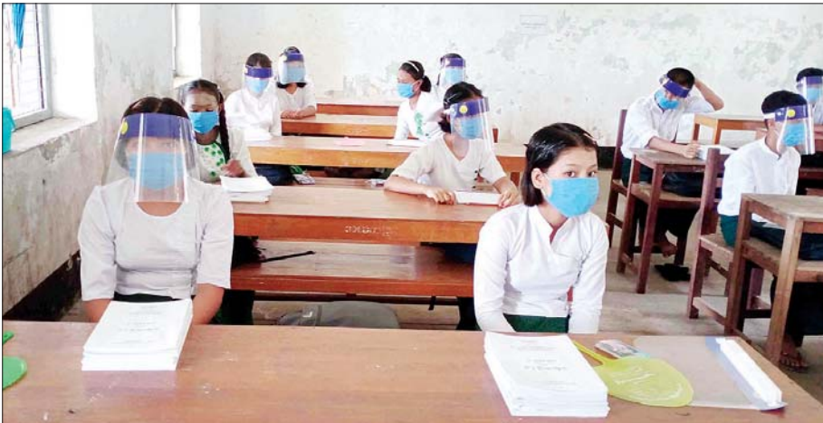
ကျောက်ဖြူမြို့နယ်၌ ကျောင်းသား ကျောင်းသူများ ပညာသင်ကြားနေမှုကို တွေ့ရစဉ်။ ပြီးဝေလင်း