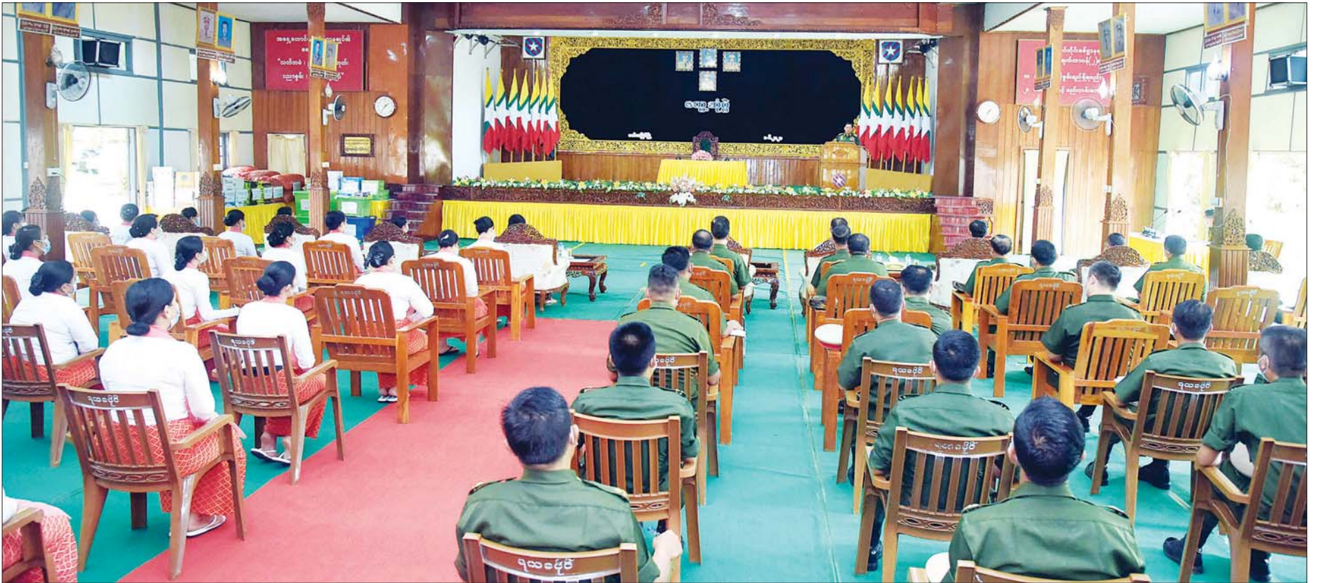
နိုင်ငံတော်စီမံအုပ်ချုပ်ရေးကောင်စီဥက္ကဋ္ဌ၊ တပ်မတော်ကာကွယ်ရေးဦးစီးချုပ် ဗိုလ်ချုပ်မှူးကြီး မင်းအောင်လှိုင် မော်လမြိုင်တပ်နယ်မှ အရာရှိ၊ စစ်သည်၊ မိသားစုများအား အမှာစကားပြောကြားစဉ်။