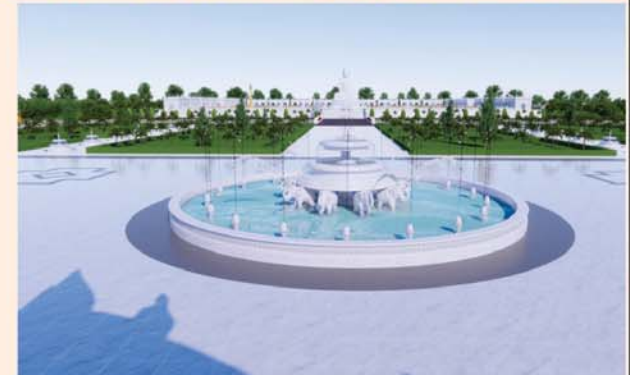
ရေပန်းအကြီး