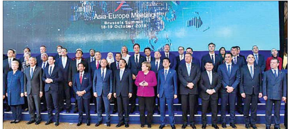
၂၀၁၈ခုနှစ်က ကျင်းပခဲ့သည့် အေဆမ်အစည်းအဝေးတွင် နိုင်ငံခေါင်းဆောင်များ မှတ်တမ်းတင်ဓာတ်ပုံ ရိုက်စဉ်။

ဆီးရီးယားအကျပ်အတည်းဖြေရှင်းရန် နိုင်ငံရေး နည်းလမ်းကို တိုးမြှင့်လုပ်ဆောင်ရန်၊ လုံခြုံရေး အခြေအနေတိုးမြှင့်ရန်၊ စီးပွားရေးနှင့် လူသားချင်း စာနာထောက်ထားမှုဆိုင်ရာ အခန်းကဏ္ဍများတွင် ဖြစ်ပေါ်နေသော စိန်ခေါ်မှုများကို ဖြေရှင်းရန် တရုတ်သံတမန်တစ်ဦးက မေ ၂၆ ရက်က တိုက်တွန်း ပြောကြားလိုက်သည်။ ဆယ်စုနှစ်ချိန်ကြာ ဖြစ်ပွားနေသော ဆီးရီးယား ပဋိပက္ခသည် လုံခြုံရေးနှင့် လူသားချင်းစာနာ ထောက်ထားမှုများကို သောကပေစေသည်။ ကုလ သမဂ္ဂ၊ လုံခြုံရေးကောင်စီတို့သည် ဆီးရီးယား ပြည်သူများ ခံစားနေရသော ဒုက္ခဒေဝဒနာများကို သက်သာစေရန် ဆီးရီးယားအကျပ်အတည်းကို စောစောစီးစီး အဆုံးသတ်ရန် အားထုတ် လုပ်ဆောင်ရမည်ဖြစ်ကြောင်း ကုလသမဂ္ဂဆိုင်ရာ တရုတ်အမြဲတမ်း ကိုယ်စားလှယ် ဇောင်ဂျန်က ပြောသည်။ ဆီးရီးယားနိုင်ငံရှိ ပါတီများအားလုံးကို ကုလသမဂ္ဂအထူးကိုယ်စားလှယ် ဂီယာဝီတာ ဆန်နှင့် ဆက်သွယ်ဆောင်ရွက်ရန်၊ ဖွဲ့စည်းပုံ အခြေခံဥပဒေကော်မတီ၏ လုပ်ငန်းစဉ်များကို ထိန်းသိမ်းရန် ၎င်းကတိုက်တွန်းထားသည်။ ဖွဲ့စည်းပုံ အခြေခံဥပဒေကော်မတီသည် လွတ်လပ်စွာဖြင့် ပြည်ပနေနှင့်ယှက်မှု ကင်းစွာ အလုပ်လုပ်ဆောင်သွားမည်ဖြစ်ကြောင်း၊ နိုင်ငံရေး လုပ်ငန်းစဉ်ဆိုင်ရာတွင် ဆီးရီးယားတို့ကိုယ်တိုင် ဦးဆောင်ပြီး ၎င်းတို့ကိုယ်တိုင် ပါဝင်သွားရန်ပင် ဖြစ်ကြောင်းနှင့် ဆီးရီးယားရှိ အခြေအနေများ တိုးတက်ရန် စွမ်းစွမ်းတမ်း လုပ်ဆောင်သင့် ကြောင်း ၎င်းက ဆက်လက် တိုက်တွန်းပြောကြား ထားသည်။ ဆင်ဟွာ