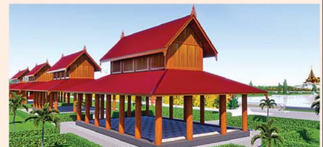
သုဓမ္မာရေဝင်(၅၄x၃၀)ပေ ၆ လုံး ၁ လုံးလျှင်-၅၅၇ သိန်း

၁။ နိုင်ငံတော်စီမံအုပ်ချုပ်ရေးကောင်စီဥက္ကဋ္ဌ၊ တပ်မတော်ကာကွယ်ရေးဦးစီးချုပ် ဗိုလ်ချုပ်မှူးကြီးမင်းအောင်လှိုင် ဦးဆောင်သည့် (၇)ရက်သား၊ သမီး၊ ဘုရားဒါယကာ၊ ဒါယိကာမတို့က မာရဝိဇယပုဒ္ဓရုပ်ပွားတော်မြတ်ကြီးအား မြန်မာနိုင်ငံတွင် ထေရဝါဒ ပုဒ္ဓသာသနာတော်ထွန်းလင်းတောက်ပလျက်ရှိသည်ကို ကမ္ဘာကိုပြသရန်၊ တိုင်းပြည်အေးချမ်းသာယာမှုရှိစေရန်၊ ရုပ်ပွားတော်မြတ်ကြီးအား ပြည်တွင်း၊ ပြည်ပဘုရားဖူးများလာရောက်ခြင်းဖြင့် ဒေသတိုးတက်စည်ကားမှုကို အထောက်အကူဖြစ်စေရန်၊ နိုင်ငံတော် ဖွံ့ဖြိုးတိုးတက်မှု အထောက်အကူဖြစ်စေရန်ရည်သန်လျက် ပြည်ထောင်စုနယ်မြေ နေပြည်တော်၊ ဒက္ခိဏသီရိမြို့နယ်အတွင်း၌ သာသနာတော်ထုံး၊ ရုပ်ပွားဆင်းတုတော်ထုံး၊ မြန်မာ့ရိုးရာတည်ထိုးမှုများနှင့်အညီ တည်ဆောက်ပူဇော်လျက်ရှိပါသည်။