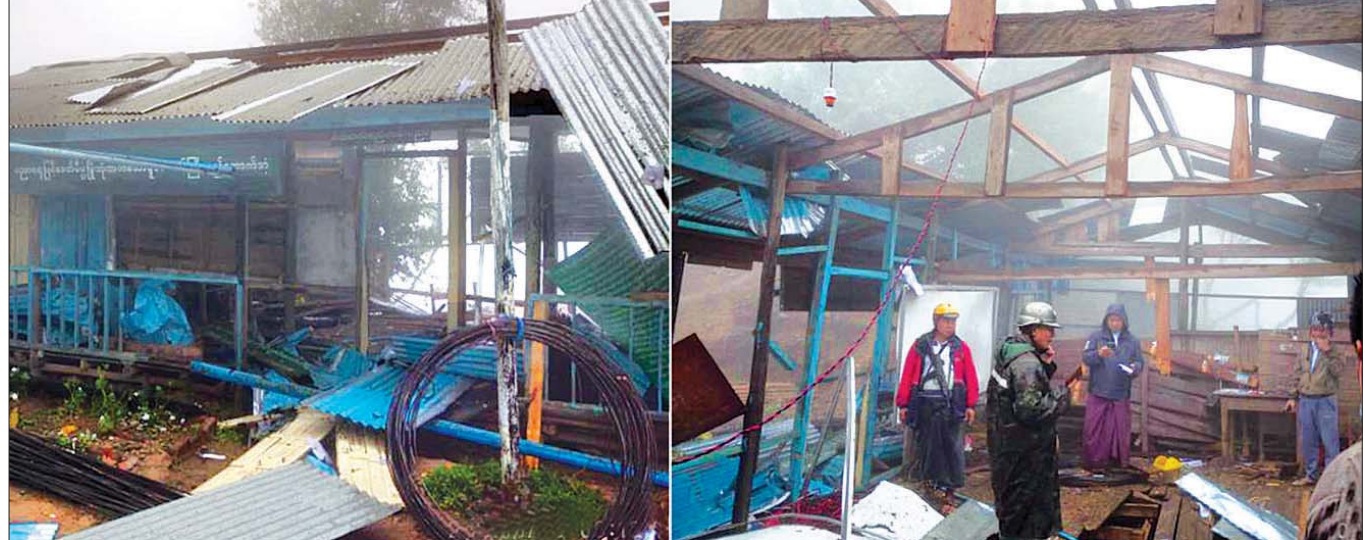
ဖလမ်းမြို့နယ် တလန်လိုရပ်ကွက်ရှိ အမှတ်(၅)အခြေခံပညာအထက်တန်းကျောင်း၌ လက်လုပ်ခိုင်းပေါက်ကွဲမှုကြောင့် ထိခိုက်ပျက်စီးမှုကို တွေ့ရစဉ်။

အလေးပေးဆောင်ရွက်လျက်ရှိသည်။ နိုင်ငံတော်အနေဖြင့် Covid-19 ကမ္ဘာ့ကပ် ရောဂါကြောင့် ၂၀၁၉-၂၀၂၀ ပညာသင်နှစ်အား ကျောင်းများ ပိတ်၍ ရပ်နားခဲ့ရသဖြင့် နိုင်ငံတော်၊ ကျောင်းသားမိဘနှင့် ကျောင်းသား ကျောင်းသူများအတွက် ပညာသင်နှစ် တစ်နှစ်တာ နှစ်နာဆုံးရှုံးခဲ့ရပြီး စာမျက်နှာ ၁၈ ကော်လံ ၁ ၀