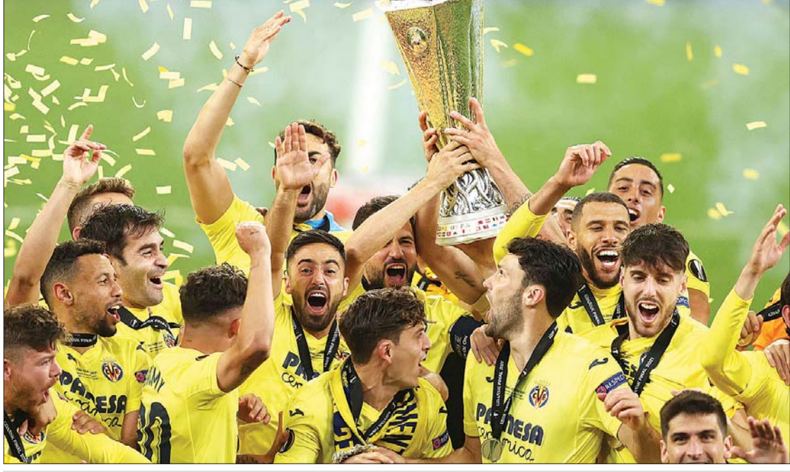
ဗီလာရီးရဲ အသင်းသားများ ယူရိုပါလိဂ်ဖလားရယူပြီးနောက် အောင်ပွဲခံနေစဉ်။

မှတ်တမ်းသစ်ရေးထိုးရန် အကောင်းဆုံးပြင်ဆင်လာ သည့်အတွက် ပွဲစသည်နှင့်တစ်ပြိုင်နက် ပြိုင်ဆိုင်မှုပြင်းထန် လာခဲ့သည်။ စာမျက်နှာ ၁၈ ကော်လံ ၁ *