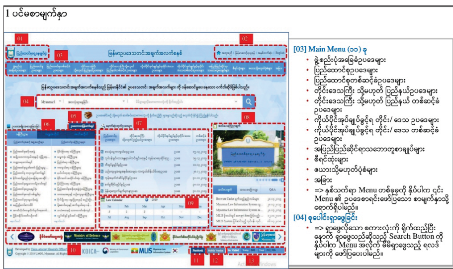
မြန်မာဥပဒေသတင်းအချက်အလက်စနစ် (Myanmar Law Information System - MLIS) ၏ ပင်မစာမျက်နှာ။

မြန်မာဥပဒေ သတင်းအချက်အလက်များသည် မြန်မာနိုင်ငံပြန်တမ်းပါ ဖော်ပြချက်များနှင့် သက်ဆိုင်ရာအစိုးရဌာန အဖွဲ့အစည်းများ၏