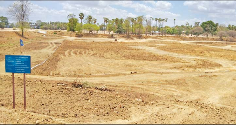
ပြန်လည်တူးဖော်ပြီးစီးသွားသည့် သောက်ရေကန်ကို တွေ့ရစဉ်။

ဖြစ်ကြောင်း သိရသည်။ ယခင်က အဆိုပါသောက်သုံး ရေကန်ကြီးသည် ကြာကန်၊ ကြာချောင်း၊ ကြာသစ်၊ လေးအိမ်ညောင်ပင်သာ၊ ကန်နှစ်ဆင့်စသည့် ကျေးရွာများမှ မိုရီနီရောသော သောက်သုံး ရေကန်ကြီးလည်းဖြစ် ကြောင်း တံတိုက်နေ ဦးဦးထံမှ သိရသည်။ အဆိုပါ သောက်ရေကန်ကြီး ပြန်လည်ပြုပြင် တူးဖော်ဆည်ဖို့ ပေးသည့်အတွက် ကန်ပတ်လည် ရှိ တံတိုက်များမှ စုစုပေါင်း အိမ်ထောင်စု ၅၀၀ ကျော်၊ လူဦး ရေ ၂၀၀၀ ကျော်နှင့် ကျွဲ နွား တိရစ္ဆာန် ၂၀၀၀ ကျော်တို့အတွက် လိုအပ်သော သောက်ရေရရှိ တော့မည်ဖြစ်၍ ကျေးဇူးတင်ရှိ ကြောင်း ကြာကန်ကျေးရွာနေ ဦးညီပေါက် ပြောသည်။ ဝင်းမောင်(မကွေး)