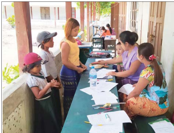
ရွှေသောင်ယံမြို့၌ ကျောင်းသူများ ကျောင်းအပ်နှံကြစဉ်။ ရွှေသောင်ယံ(ပြန်/ဆက်)