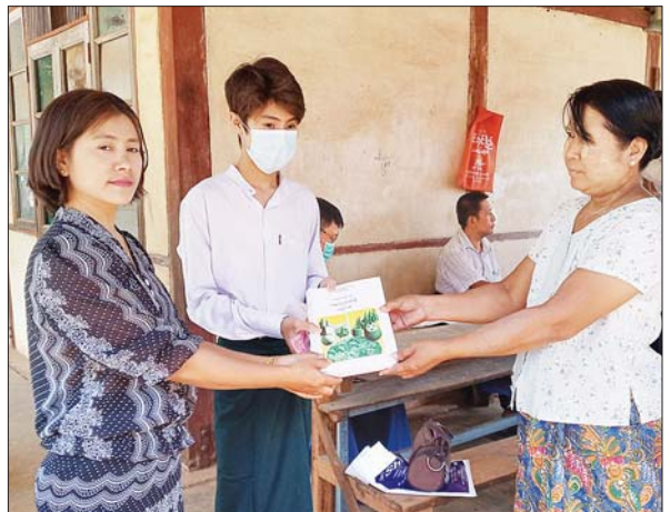
ကျောက်ပန်းတောင်းမြို့နယ်၌ ကျောင်းသားတစ်ဦးအား ကျောင်းသုံးစာအုပ်များ ပေးအပ်စဉ်။ နေအောင်(ပြန်/ဆက်)