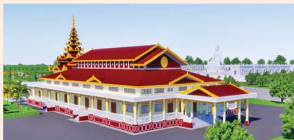
ဓမ္မာရုံ(၂၃၁x၉၀)ပေ ၁ လုံး-၈၇၀၀ သိန်း