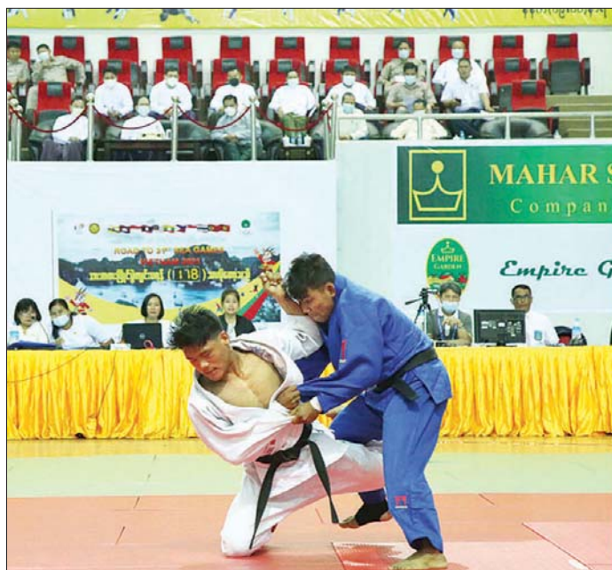
Phang နော်တောင်နှင့်အတူ ဒုတိယဝန်ကြီး ဦးမျိုးလှိုင်နှင့် တာဝန်ရှိသူများ တက်ရောက်ကြည့်ရှုအားပေးကြပြီး (အပေါ်ပုံ) ပထမဆုရရှိသော Gold Camp

ဝဏ္ဏသိဒ္ဓိအားကစားရုံ (A) ၌ ကျင်းပလျက်ရှိသော ဂျူဒိုဆန်းစစ်ပြိုင်ပွဲကျင်းပနေမှုကို တက်ရောက်ကြည့်ရှုအားပေးသည်။ အဆိုပါ ပြိုင်ပွဲတွင် ဂျူဒိုအသင်းလိုက် Mix Team ပြိုင်ပွဲများ ကျင်းပခဲ့ကြသည်။ ကြည့်ရှုအားပေးဆက်လက်၍ ပြည်ထောင်စုဝန်ကြီးနှင့်အဖွဲ့သည် ဝဏ္ဏသိဒ္ဓိမြားပစ် အားကစားကွင်းတွင် ကျင်းပလျက်ရှိသည့် လက်ရည်ဆန်းစစ် မြားပစ်ပြိုင်ပွဲတွင် Compound Ranking Round နှင့် Recurve Ranking Round ပြိုင်ပွဲများ ကျင်းပနေမှုကို ကြည့်ရှုအားပေးသည်။ ငွေသားဆုများကို ချီးမြှင့်မွန်းလွှဲပိုင်းတွင် ဂျူဒိုပြိုင်ပွဲ ဗိုလ်လုပွဲစဉ်များကို ဆက်လက်ကျင်းပရာ နိုင်ငံတော်စီမံအုပ်ချုပ်ရေးကောင်စီအဖွဲ့ဝင် Jeng