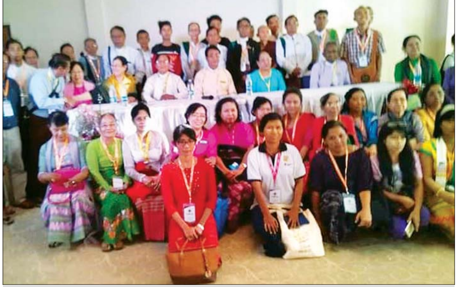
ကဗျာဆုနှစ်ဆယ့်ပေးရေး စာပေစကားဝိုင်းအပြီး ဆွေးနွေးဟောပြောသူများနှင့် မှတ်တမ်းတင်ဓာတ်ပုံ ရိုက်စဉ်။

ကျွန်မ တကယ်ကို မှတ်မိနေတဲ့ ဂန္ထဝင်ကဗျာ၊ ခေတ်ပေါ်ကဗျာလေးတွေ အားလုံး လန်းဆန်းစိုပြည် အလှဆင်နိုင်ကြပါစေရှင်။