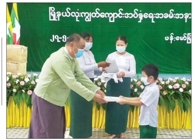
ဗန်းမော်မြို့နယ်၌ တာဝန်ရှိသူတစ်ဦးက ကျောင်းသားတစ်ဦးအား စာရေးကိရိယာများ ပေးအပ်စဉ်။ ဝဇ္ဇာ