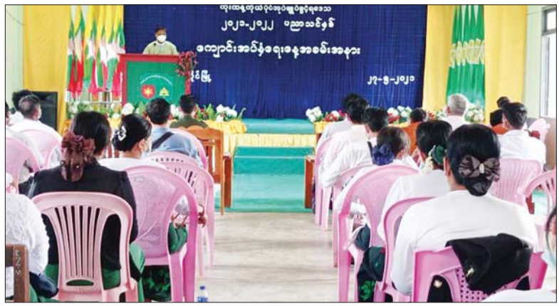
လောက်ကိုင်မြို့နယ်၌ မြို့နယ်အဆင့် ကျောင်းအပ်နှံရေးနေ့ အခမ်းအနား ကျင်းပစဉ်။ မြို့နယ်(ပြန်/ဆက်)