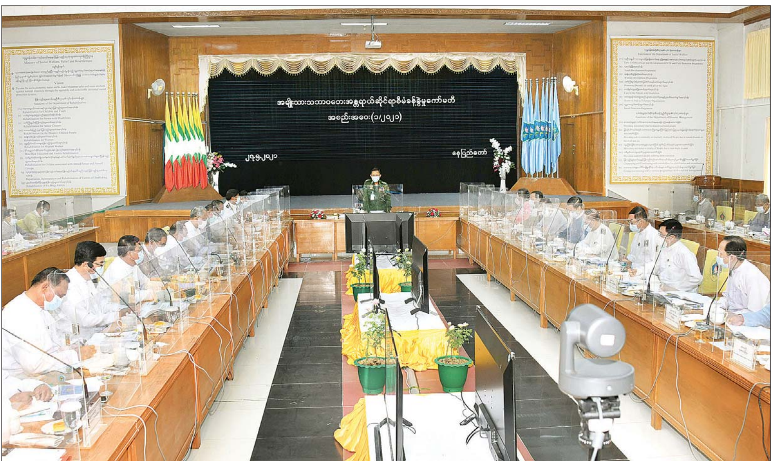
အမျိုးသားသဘာဝဘေးအန္တရာယ်ဆိုင်ရာ စီမံခန့်ခွဲမှုကော်မတီ ဥက္ကဋ္ဌ၊ နိုင်ငံတော်စီမံအုပ်ချုပ်ရေးကောင်စီ ဒုတိယဥက္ကဋ္ဌ၊ ဒုတိယတပ်မတော်ကာကွယ်ရေးဦးစီးချုပ်၊ ကာကွယ် ရေးဦးစီးချုပ်(ကြည်း) ဒုတိယဗိုလ်ချုပ်မှူးကြီး စိုးဝင်း အမျိုးသားသဘာဝဘေးအန္တရာယ်ဆိုင်ရာ စီမံခန့်ခွဲမှုကော်မတီ (၁/၂၀၂၁) အစည်းအဝေးတွင် အမှာစကားပြောကြားစဉ်။

❑ မြန်မာနိုင်ငံ၏ ရေ၊ မြေ သဘာဝအနေအထားအရ ၂၀၀၀ ပြည့်နှစ်မှ ၂၀၁၀ ပြည့်နှစ်အထိ ၁၀ နှစ်တာကာလအတွင်း ဖြစ်ပွားခဲ့သည့် ဘေးအန္တရာယ်များမှ ၂၃ ရာခိုင်နှုန်းမှာ မီးဘေးကြောင့် ဖြစ်ပွားခဲ့ပြီး ၁၁ ရာခိုင်နှုန်းမှာ ရေလွှမ်းမိုးခြင်း၊ ၁၂ ရာခိုင်နှုန်းမှာ လေပြင်းမုန်တိုင်း ကျရောက်မှုကြောင့်ဖြစ်ပြီး ၄ ရာခိုင်နှုန်းမှာ မြေငလျင်လှုပ်ခြင်း၊ ဆူနာမီနှင့် မြေပြိုခြင်းများကြောင့်ဖြစ်သည်ကို တွေ့ရ