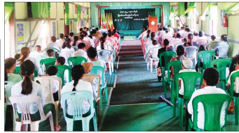
ကျေးဇူးမြို့နယ်၌ မြို့နယ်အဆင့် ကျောင်းအပ်နှံရေးနေ့ အခမ်းအနား ကျင်းပစဉ်။ မြို့နယ်(ပြန်/ဆက်)