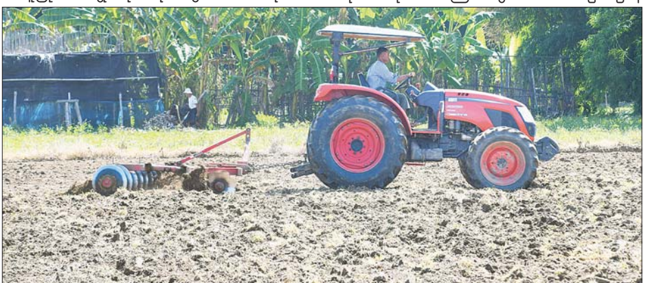
ရွှေညောင်တုန်း သမဝါယမအသင်းပိုင် ထွန်စက်များဖြင့် ထွန်ယက်ပေးနေမှုကို တွေ့ရစဉ်။

ထိုအထဲတွင် ညောင်တုန်းမြို့နယ်၌ အသင်း သားပေါင်း တစ်သောင်း ရှစ်ထောင်ကျော်ဖြင့် အခြေခံ သမဝါယမအသင်းမှစ၍ အသင်းအဆင့်ဆင့်ဖြင့် သမဝါယမအသင်း ၂၀၅ သင်း ဖွဲ့စည်းနိုင်ခဲ့ပြီဖြစ်ရာ ဧရာဝတီတိုင်းဒေသကြီးအတွင်း သမဝါယမဦးစီးဌာန