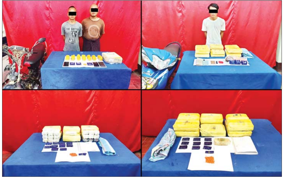
သိမ်းဆည်းရမိသည့် မူးယစ်ဆေးဝါးများနှင့်အတူ ဖမ်းဆီးရမိသူများကို တွေ့ရစဉ်။