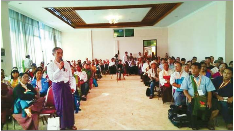
ကဗျာဆုနှစ်ဆယ့်ပေးရေးအတွက် ပြုလုပ်သည့် စာပေစကားဝိုင်းသို့ တက်ရောက်နားထောင်ကြသူများကို တွေ့ရစဉ်။

အားလုံးအတိုင်းမသိ ပျော်ရွှင်ကြရပါတယ်။ အနှစ် ကိုလည်း မပစ်ပယ်။ အသစ်ကိုလည်း ချစ်စဖွယ်ကို အားလုံးက တညီတညွတ်တည်း ဆုံးဖြတ်ခဲ့ကြတာ ဟာ ဘယ်လောက်များ တရားမျှတလိုက်ပါသလဲ။ ကျွန်မ နှုတ်ဖျားမှာ ညီညွတ်ရေးနဲ့ အသက်ရှည်ရှည် ခင်ခင်မင်မင်ဆိုတဲ့ သီချင်းလေးကို တဖွဖွ ရေရွတ် နေမိပါတယ်။