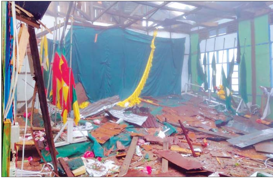
အကြမ်းဖက်သူများဖောက်ခွဲဖျက်ဆီးမှုကြောင့် ပျက်စီးသွားသည့် ဖလမ်းမြို့ အမှတ်(၂)အခြေခံပညာအထက်တန်းကျောင်းကို တွေ့ရစဉ်။

များစွာနစ်နာမှုများ ဖြစ်ပေါ်ခဲ့ရသည်။ ကျောင်းများဖွင့်လှစ်နိုင်ရေးပြင်ဆင်နိုင်တော်မီမီအုပ်ချုပ်ရေးကောင်စီအနေဖြင့် ပညာသင်ခွင့် နောက်တစ်နှစ် ထပ်မံမဆုံးရှုံးစေရေးအတွက် COVID-19 ရောဂါအား အထိုက်အလျောက် ထိန်းသိမ်းထားနိုင်သည့်ကာလတွင် COVID-19 ကာကွယ်၊ ထိန်းချုပ်၊ ကုသရေးစည်းကမ်းချက်များနှင့်အညီ ဇွန် ၁ ရက်မှစ၍ နိုင်ငံနှင့်အဝန်း ကျောင်းများ ပြန်လည်ဖွင့်လှစ်နိုင်ရေးအတွက် ကြီးကြပ်ဆောင်ရွက်လျက်ရှိရာ လက်ရှိအချိန်ကာလတွင် ကျောင်းသား ကျောင်းသူများအား ကျောင်းအပ်နှံနိုင်ရေးကို အရှိန်အဟုန်ဖြင့် ဆောင်ရွက်လျက်ရှိသည်။ ကျောင်းဖွင့်လှစ်နိုင်ရေး ပြင်ဆင်မှုများ ဆောင်ရွက်ရာတွင် ကျောင်းသား ကျောင်းသူများ မိုးလုံလေလုံဖြင့် ကောင်းမွန်စွာ ကျောင်းတက်နိုင်ရေး ပြင်ဆင်ခြင်း၊ သင်ရိုးစာအုပ်နှင့် သင်ထောက်ကူပစ္စည်းများ၊ COVID-19 ကာကွယ်ရေးဆိုင်ရာ Mask၊ Face Shield များ အခမဲ့ပေးဝေနိုင်ရေးနှင့် လက်ဆေးရန် နေရာတို့မှစ၍ ပြင်ဆင်မှုများ ဆောင်ရွက်ပေးလျက်ရှိသည်။ နိုင်ငံတော်အနေဖြင့် ထိုသို့စီမံဆောင်ရွက်လျက်ရှိသော်လည်း နိုင်ငံတော်၏ အမျိုးသားအကျိုးစီးပွားကို ပျက်စီးစေလိုသည့် နိုင်ငံရေးအစွန်း