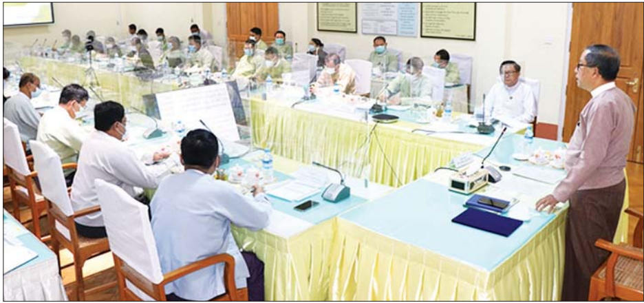
သွားမည့် လုပ်ငန်းစဉ်များကိုလည်းကောင်း တင်ပြ ဆွေးနွေးခဲ့ကြသည်။ မြစ်မီးရောင်ကျေးရွာစီမံကိန်းသည် နိုင်ငံတစ်ဝန်းလုံးရှိ ကျေးရွာ ၂၂ ရာခိုင်နှုန်းခန့်ကို လွှမ်းခြုံထားပြီး ကျေးလက်ပြည်သူ ရှစ်သန်းကျော်အား အကျိုးပြုလျက်ရှိရာ စီမံကိန်းလုပ်ငန်းများ ပိုမိုအောင်မြင်ရေး ကြိုးပမ်းသွားမည်ဖြစ်ကြောင်း၊ လူထုဗဟိုပြုဖွံ့ဖြိုးရေး ချည်းကပ်မှု နည်းလမ်းဖြင့် ကျေးရွာအခြေခံအဆောက်အအုံ ဖွံ့ဖြိုးရေးလုပ်ငန်းများ၊ အသက်မွေးဝမ်းကျောင်း ဖွံ့ဖြိုးရေးလုပ်ငန်းများ ဆောင်ရွက်ပေးလျက်ရှိကြောင်း၊ ကျေးရွာပိုင် အရင်းမပျောက် မတည်ငွေများ ရေရှည်အကျိုးရှိစွာ အသုံးပြုနိုင်ရေးအတွက် ကြံ့တော့နိုင်သည့် အခက်အခဲများကို ကြိုတင်မျှော်မှန်း၍ ကျေးလက်ဒေသ ဖွံ့ဖြိုးတိုးတက်ရေးဦးစီးဌာန တာဝန်ရှိသူများနှင့် ဒေသခံပြည်သူများ ပိုမိုထိတွေ့ကာ အကောင်းဆုံးနည်းလမ်းများ ရှာဖွေဆောင်ရွက်လျက်ရှိကြောင်း သိရသည်။ သတင်းစဉ်

လိုအပ်ကြောင်း ဆွေးနွေးပြောကြားသည်။ ဆက်လက်၍ ဒုတိယဝန်ကြီး ဒေါက်တာအောင်ကြီးက နိုင်ငံ့ဝန်ထမ်းဥပဒေ နည်းဥပဒေများနှင့်အညီ အကတိတရားကင်းရှင်းစွာ ဆောင်ရွက်ရန် လိုအပ်ချက်များ၊ စိုက်ပျိုး မွေးမြူရေးလုပ်ငန်းများနှင့် အသေးစားအိမ်တွင်းမှုလုပ်ငန်းများ အခြေခံသည့် အလုပ်အကိုင်အခွင့်အလမ်းများ ဖန်တီးဖော်ဆောင်ပေးရန် လိုအပ်ချက်များကို ဆွေးနွေးပြောကြားသည်။ ထို့နောက် ကျေးလက်ဒေသဖွံ့ဖြိုးတိုးတက်ရေး ဦးစီးဌာန ညွှန်ကြားရေးမှူးချုပ် ဦးခန့်ဇော်က မြစ်မီးရောင်စီမံကိန်းလုပ်ငန်းများနှင့် ဆက်လက်အကောင်အထည်ဖော်ဆောင်ရွက်မည့် လုပ်ငန်းစဉ်များကိုလည်းကောင်း၊ ဆွေးနွေးပွဲသို့ တက်ရောက်လာကြသည့် ဦးစီးဌာနများမှ ညွှန်ကြားရေးမှူးချုပ်များက ကျေးလက်ဒေသဖွံ့ဖြိုးရေးအတွက် သက်ဆိုင်ရာကဏ္ဍများအလိုက် ပူးပေါင်းဆောင်ရွက်