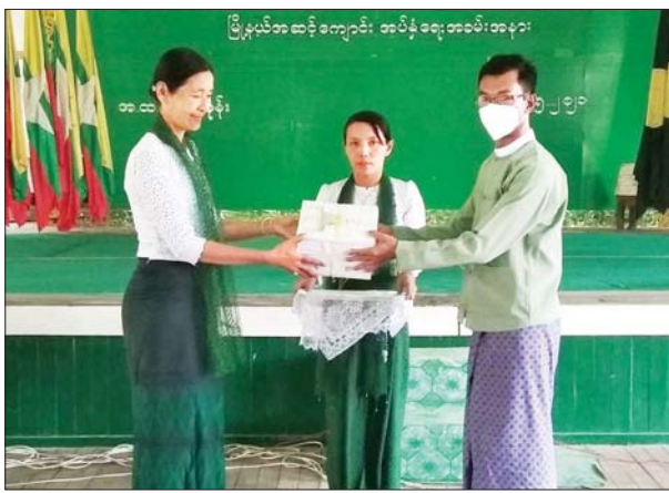
ဇီးကုန်းမြို့နယ်၌ ကျောင်းသား ကျောင်းသူများအတွက် ထောက်ပံ့ပစ္စည်းများ ပေးအပ်စဉ်။ တင့်ဆွေ(ပြန်/ဆက်)