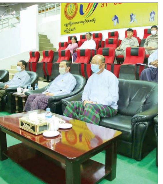
(A) အသင်းကို နိုင်ငံတော်စီမံအုပ်ချုပ်ရေးကောင်စီ အဖွဲ့ဝင် Jeng Phang နော်တောင်က တစ်ဦးချင်းဆုတံဆိပ်နှင့် ငွေသားဆုများကိုလည်းကောင်း၊ မြန်မာ