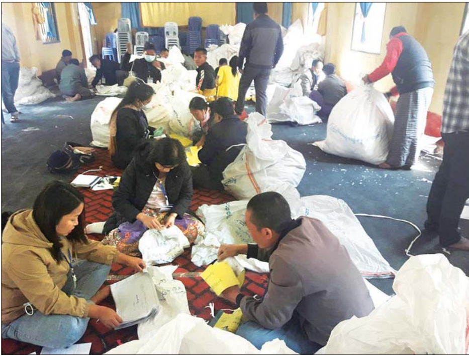
ဟားခါးမြို့နယ် ဆန္ဒမဲလက်မှတ် မြေပြင်စစ်ဆေးမှု မှတ်တမ်းဓာတ်ပုံ။

❖ မဲရုံအိတ်ပျောက်ဆုံးမှုနှင့်စပ်လျဉ်း၍ မတူပီမြို့နယ် ရွေးကောက်ပွဲကော်မရှင်အဖွဲ့ခွဲ အတွင်းရေးမှူးက ၁၄-၄-၂၀၂၁ ရက်နေ့ ၁၆:၀၀ အချိန်ခန့်တွင် ခြန်းပြန်းကျေးရွာ အုပ်စု ရွေးကောက်ပွဲကော်မရှင်အဖွဲ့ခွဲ အတွင်းရေးမှူးထံသို့ ဆက်သွယ်မေးမြန်းခဲ့ရာ ယင်း၏နေအိမ်တွင် သိမ်းဆည်းထားကြောင်း သိရှိရသဖြင့် ပြန်လည်လာရောက်အပ်နှံရန် အကြောင်းကြားခဲ့ရပါသည်။ ခြန်းပြန်းကျေးရွာအုပ်စု ရွေးကောက်ပွဲကော်မရှင်အဖွဲ့ခွဲ အတွင်းရေးမှူးက အဆိုပါ သုံးစွဲ၊ လက်ကျန်စာအုပ်များ ထည့်သွင်းထားသော ကြွပ်ကြွပ် အိတ်အား ၁၅-၄-၂၀၂၁ ရက်နေ့ ၁၀:၀၀ အချိန်ခန့်တွင် လာရောက်အပ်နှံခဲ့သဖြင့် စိစစ် နိုင်ခဲ့သော်လည်း ရှာရစ်ကျေးရွာအုပ်စု၊ တီးနီးယားကျေးရွာ မဲရုံအမှတ်(၃)မှ ပြည်သူ့ လွှတ်တော်၊ အမျိုးသားလွှတ်တော်၊ ပြည်နယ်လွှတ်တော်တို့အတွက် ဆန္ဒမဲလက်မှတ် သုံးစွဲ၊ လက်ကျန်စာအုပ်များ၊ မဲစာရင်းပုံစံ(၁) တို့ ပါဝင်သိမ်းဆည်းထားသော မဲရုံအိတ်အား ရှာဖွေတွေ့ရှိခြင်းမရှိကြောင်း စိစစ်တွေ့ရှိရ