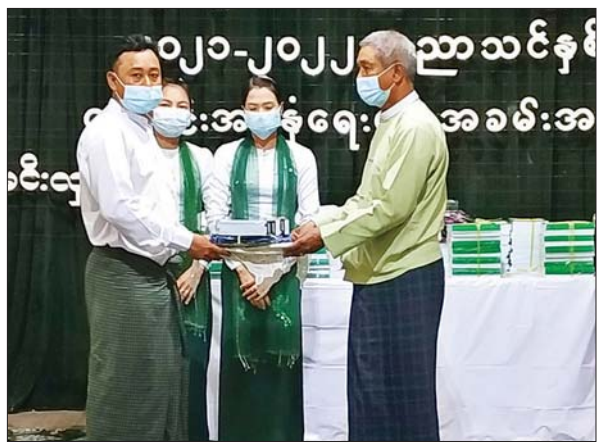
မင်းလှမြို့နယ်၌ ကျောင်းသား ကျောင်းသူများအတွက် ထောက်ပံ့ပစ္စည်းများ ပေးအပ်စဉ်။ မြို့နယ်(ပြန်/ဆက်)