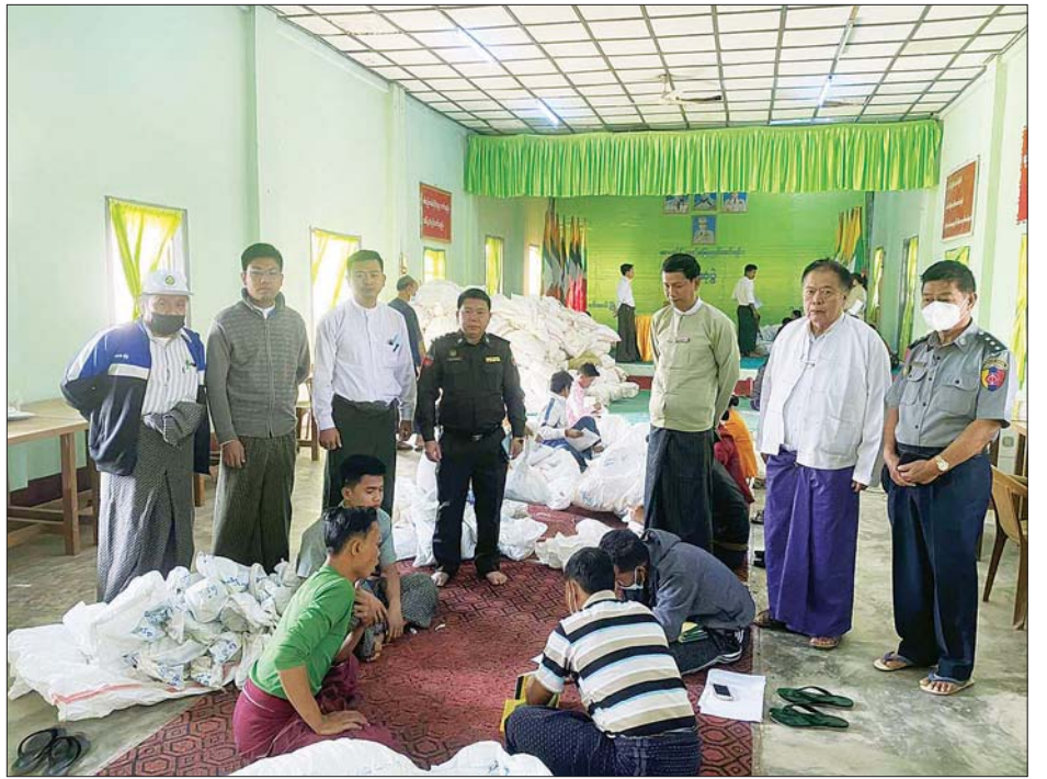
မင်းတပ်မြို့နယ် ဆန္ဒမဲလက်မှတ် မြေပြင်စစ်ဆေးမှု မှတ်တမ်းဓာတ်ပုံ။