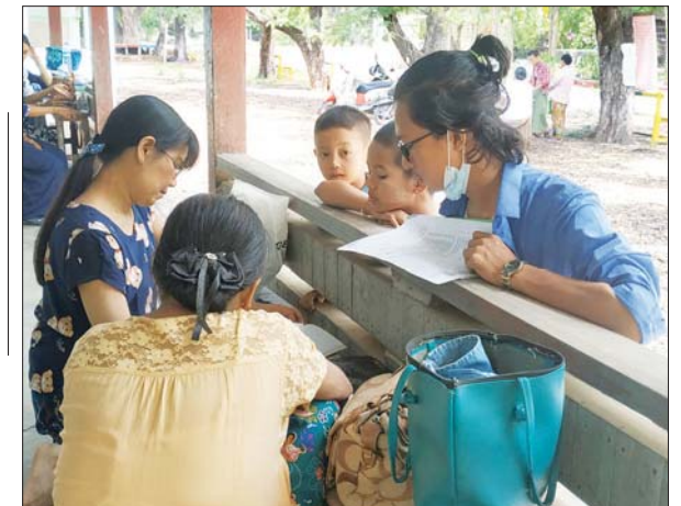
ရေဦးမြို့နယ်၌ ကျောင်းသား ကျောင်းသူများ ကျောင်းအပ်နှံကြစဉ်။ သန်းထိုက်(ရေဦး)