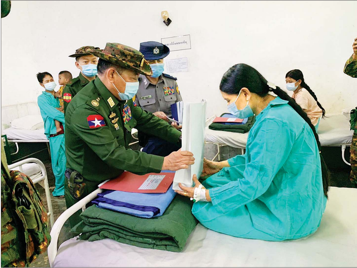
နိုင်ငံတော်စီမံအုပ်ချုပ်ရေး ကောင်စီအဖွဲ့ဝင်၊ ပြည်ထဲရေးဝန်ကြီးဌာန ပြည်ထောင်စုဝန်ကြီး ဒုတိယဗိုလ်ချုပ်ကြီး စိုးထွဋ် လှိုင်ကော်တပ်နယ်ရှိ နယ်မြေခံတပ်မတော်ဆေးရုံ၌ လူနာတစ်ဦးအား အသုံးအဆောင်ပစ္စည်းနှင့် ထောက်ပံ့ငွေများ ပေးအပ်စဉ်။