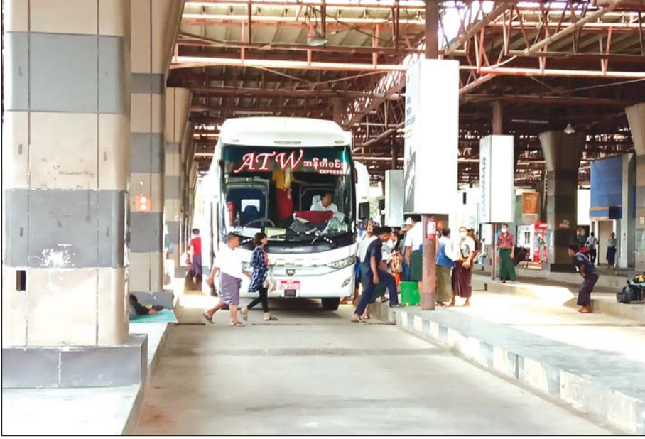
အောင်မင်္ဂလာအဝေးပြေးဝင်းသို့ ဝင်ရောက်လာသော အဝေးပြေးယာဉ်တစ်စီးကို တွေ့ရစဉ်။

ရန်ကုန် မေ ၂၆ ရန်ကုန်မြို့မှ မြန်မာပြည်တစ်ဝန်းသို့ ခရီးသွားလာမှု ပွင့်လန်းလာလျက်ရှိရာ မေလဆန်းမှစ၍ ခရီးသွား လာမှုတိုးလာသောကြောင့် အောင်မင်္ဂလာအဝေး ပြေးယာဉ်လိုင်းများတိုးချဲ့ပြေးဆွဲပေးမှုဖြင့် အများ ပြည်သူခရီးသွားလာမှု အဆင်ပြေလျက်ရှိပြီး ယာဉ် လိုင်းများ လုပ်ငန်းလုပ်ဆောင်မှုမှ ဝင်ငွေတိုးပြီး လူမှုစီးပွားကဏ္ဍမှာလည်း အဆင်ပြေလာကြောင်း သိရသည်။