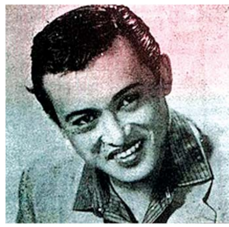
ပြည်သူ့အချစ်တော် ရုပ်ရှင်မင်းသားကြီး ရွှေဘ

စားရေးအတွက် တာဝန်ယူကြတဲ့အချိန်မှာ ဦးဖိုးစိန်ထံကိုလည်း အလှူခံထွက်ကြပါသတဲ့။ ဦးဖိုးစိန်က “မင်းတို့သူပုန်တွေအတွက် ဘာဖြစ်လို့ အလှူငွေထည့်ရမှာလဲ”လို့ ပြောလိုက်သတဲ့။ အဲဒီဂယက်ဟာ ကျောင်းသားတွေ၊ မြို့ခံတွေနဲ့ ပရိသတ်အားလုံးဆီကို ဖျံ့နှံ့သွားတဲ့အခါ “ဖိုးစိန်ကို မကြည့်ကြနဲ့”ဆိုတဲ့ စကားသံတွေနဲ့ ယနေ့ခေတ် Social Punishment လုပ်သလို Boycott လုပ်ခံရပါသတဲ့။ တဖြည်းဖြည်းနဲ့ တစ်နိုင်ငံလုံးက ပါဝင်လာတဲ့အတွက် နောက်ဆုံးမှာ သူကိုယ်တိုင်လည်း သတင်းစာတွေကနေ တစ်ဆင့်တောင်းပန်ရသလို ဆရာကြီးသခင်