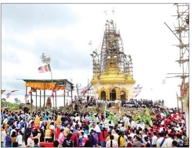
ရာ အထက်ရွှေထီးတော်၊ စိန်ဖူး ပေ ၄၀၀၊ အရံစေတီ ပေါင်း ၁၄၀ တော်၊ ငှက်မြတ်နားတော်မှ ၅၅ ပေ၊ ရှိပြီး ယခုအခါ အရံစေတီတော် အောက်ပစ္စယ်မှ အထက်ပစ္စယ် အားလုံး ထီးတော်တင်လှူပြီးစီးခဲ့ အထိ ပေ ၂၂၀ (၁၀၈ တောင်) ကြောင်းလည်း သိရှိရသည်။ ရှိပြီး ရင်ပြင်တော် ပတ်လည် မြို့နယ်(ပြန်/ဆက်)

ရှေးဦးစွာ ဓနကိုယ်ပိုင် အုပ်ချုပ်ခွင့်ရဒေသ၊ စိန်ဖူးတော်၊ ငှက်မြတ်နားတော်၊ ရွှေထီးတော်တင်လှူခြင်းမင်္ဂလာအခမ်းအနားအား စကြာရတနာစုဥက္ကဋ္ဌမှန်ဘုရား၌ မေ ၂၅ ရက်(ကဆုန်လပြည့်နေ့) နံနက် ၁၀ နာရီက ကျင်းပသည်။ ရှေးဦးစွာ ဓနကိုယ်ပိုင် အုပ်ချုပ်ခွင့်ရဒေသ၊ စိန်ဖူးတော်၊ ငှက်မြတ်နားတော်၊ ရွှေထီးတော်တင်လှူခြင်းမင်္ဂလာအခမ်းအနားအား စကြာရတနာစုဥက္ကဋ္ဌမှန်ဘုရား၌ မေ ၂၅ ရက်(ကဆုန်လပြည့်နေ့) နံနက် ၁၀ နာရီက ကျင်းပသည်။ ရှေးဦးစွာ ဓနကိုယ်ပိုင် အုပ်ချုပ်ခွင့်ရဒေသ၊ စိန်ဖူးတော်၊ ငှက်မြတ်နားတော်၊ ရွှေထီးတော်တင်လှူခြင်းမင်္ဂလာအခမ်းအနားအား စကြာရတနာစုဥက္ကဋ္ဌမှန်ဘုရား၌ မေ ၂၅ ရက်(ကဆုန်လပြည့်နေ့) နံနက် ၁၀ နာရီက ကျင်းပသည်။