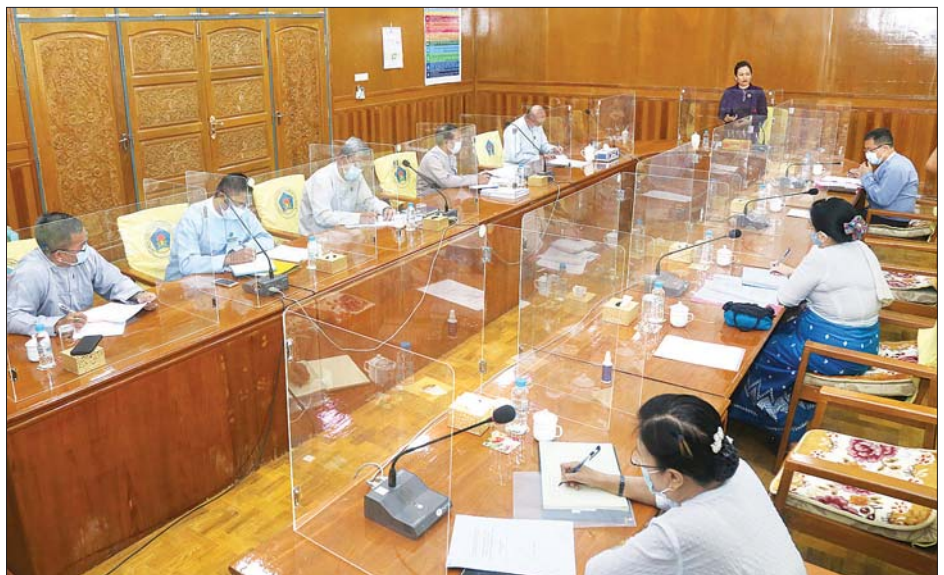
အခြေအနေများ၊ အလွယ်တကူ လက်လှမ်းမီ ရယူအသုံးပြုနိုင်မှု ကဏ္ဍများအလိုက် ချိတ်ဆက် ထားသည့် ASEAN Enabling Master Plan (2025) ၊ Myanmar Sustainable Development Plan (MSDP) ၊ အင်ဒိုနီးရှား မဟာ ဗျူဟာနှင့် ဝန်ကြီးဌာနများမှ ရေးဆွဲပြဋ္ဌာန်းထားသည့် မူဝါဒ၊ စီမံကိန်းများနှင့် စပ်လျဉ်း၍ ရှင်းလင်းတင်ပြ ရာ ပြည်ထောင်စုဝန်ကြီးနှင့် တက်ရောက် လာကြသူများက ဖြည့်စွက် အကြံပြုဆွေးနွေး ကြသည်။ သတင်းစဉ်

အတွက် နိုင်ငံတကာက လက်ခံ ထားသည့် အခြေခံမူကြမ်းဖြစ်ပါ ကြောင်း၊ မဟာဗျူဟာ(၅)နှစ် စီမံကိန်းအတည်ပြု ပြဋ္ဌာန်းပြီး ပါကဆက်လက်အကောင်အထည် ဖော်ဆောင်ရွက်ရမည့် လုပ်ငန်း စဉ်များကိုလည်း ထည့်သွင်းရမည် ဖြစ်ကြောင်း ပြောကြားသည်။ ထို့နောက်ပြန်လည်ထုထောင် ရေးဦးစီးဌာန၊ ထိုစိုက်လွယ်အုပ်စု များဌာနခွဲ ညွှန်ကြားရေးမှူးက ရေးဆွဲထားသောမသန်စွမ်းသူများ ၏ အခွင့်အရေးများဆိုင်ရာ အမျိုးသားအဆင့် မဟာဗျူဟာ (၅) နှစ်စီမံကိန်း (၂၀၂၁-၂၀၂၅) နှင့်စပ်လျဉ်း၍ အခန်း (၆) ခန်းဖြစ် သော ကျန်းမာရေး၊ ပညာရေး၊ လုပ်ငန်းနှင့် အလုပ်အကိုင်၊ လူမှု ကာကွယ်စောင့်ရှောက်ရေး၊ သဘာဝဘေးနှင့်အခြားအရေးပေါ်