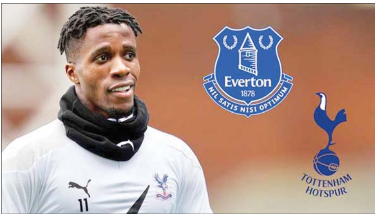
ခရစ္စတယ်ပဲလေ့စ် တိုက်စစ်ကစားသမား ဇာဟာ။