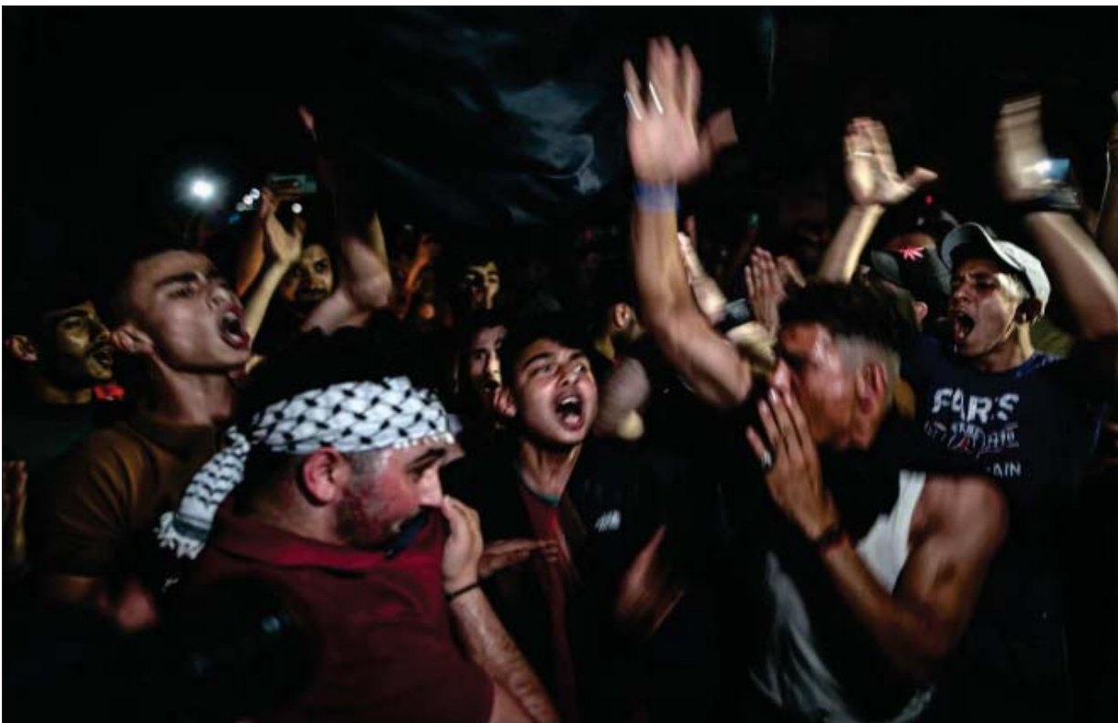
အပစ်အခတ်ရပ်စဲရေးကို ကြေညာပြီးနောက် ပါလက်စတိုင်းများ ဝမ်းသာပျော်ရွှင်နေကြပုံ။

ကျန်းသေတာကတော့ နှစ်ဖက်စလုံးက အဲဒါတွေကို ချိုးဖောက် ကြတာပဲဖြစ်ပါတယ်။ ဟားမားစ်တို့က အစွမ်းမြို့တော်တွေနဲ့ မြို့တွေဘက်ကို ခိုးလက်နက် အလုံးရေ ၃၀၀၀ နီးပါး ပစ်ခတ်ပါတယ်။ ဒါဟာ စစ်ရာဇဝတ်မှုကျူးလွန်တာပဲ ဖြစ်ပါတယ်။ တစ်ဖက် အစွမ်း တို့ကလည်း အရပ်သားသေဆုံးမှုတွေကိုရှောင်ရှားမယ်လို့ ဘယ်လိုပဲ ဆိုဆို ဂါဇာကို ပြင်းထန်တဲ့ စစ်မြေပြင်မဖြစ်စေရဘူးလို့ ဘယ်လိုပင်