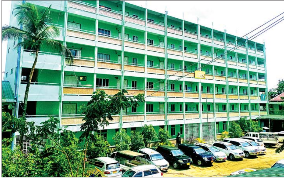
ရန်ကုန်မြို့ တောင်ဥက္ကလာပမြို့နယ် မြင်သာမြို့နယ် ဘုန်းတော်ကြီးသင်ပညာရေးကျောင်းကို တွေ့ရစဉ်။

နိုးဆော်ပေးထား “လာမယ့် ပညာသင်နှစ်မှာ ရန်ကုန်တိုင်းဒေသကြီးအတွင်းရှိ ဘုန်းတော်ကြီးသင်ပညာရေး ကျောင်းတွေအားလုံး ပြန်လည်ဖွင့်လှစ်သင်ကြား ပေးသွားမှာပါ။ ဘုန်းဘုန်းတို့ အနေနဲ့လည်း ဘက ကျောင်းအားလုံးကိုပြန်လည်ဖွင့်လှစ်ဖို့ ညွှန်ကြားနိုးဆော်ပေးထားပြီးပါပြီ။ စဖွင့်လို့ နှစ်ပတ်လောက်ဆိုရင်ပဲ ဘက ကျောင်းတွေအားလုံး အဖွဲ့နဲ့သွားရောက် စစ်ဆေးမှုတွေ လုပ်ဆောင်သွားမှာပါ။ အဓိက လိုအပ်တာကတော့ အေးချမ်းစွာ ပညာသင်ကြားနိုင်ဖို့ သက်ဆိုင်ရာအနေနဲ့ တစ်ဖက်တစ်လမ်းက စောင့်ရှောက်ပေးသွားဖို့ပဲ အရေးကြီးပါတယ်။ နိုင်ငံတော်အနေနဲ့လည်း လိုအပ်တာတွေ ထောက်ပံ့တယ်ဆိုတော့ အဆင်ပြေပါတယ်။ အခုလည်း ဘကကျောင်းတွေကို စာအုပ်၊ ခဲတံကအစ ပညာရေးထောက်ပံ့