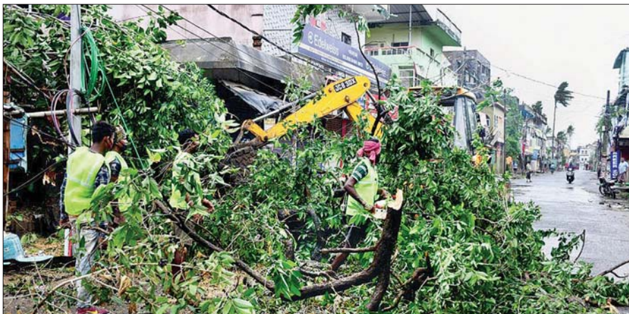
အင်အားပြင်းဆိုင်ကလုနီးမုန်တိုင်း ယာစ် ဩဒိသပြည်နယ်ဘလားဆော့ဒေသသို့ ဝင်ရောက်တိုက်ခတ်ပြီးနောက် အမြစ်မှကျွတ်ထွက်သွားသော သစ်ပင်ကြီးကို စည်ပင်သာယာဝန်ထမ်းများ ရှင်းလင်းရေးလုပ်ဆောင်နေသည်ကို တွေ့ရစဉ်။

နယူးဒေလီ မေ ၂၆ အိန္ဒိယနိုင်ငံ အရှေ့ပိုင်းပြည်နယ်များဖြစ်သည့် အနောက်ဘင်္ဂလားနှင့် ဩဒိသပြည်နယ်၏ ပင်လယ်ကမ်းရိုးတန်းဒေသများသို့ အင်အားပြင်းဆိုင်ကလုနီးမုန်တိုင်း ယာစ် ဝင်ရောက်တိုက်ခတ်ပြီးနောက် လူငါးဦး သေဆုံးခဲ့ကြောင်း ပြည်တွင်း မီဒီယာများတွင် သတင်းဖော်ပြထားသည်။ ဆိုင်ကလုနီးမုန်တိုင်းသည် တစ်နာရီလျှင် လေတိုက်နှုန်း ၁၃၀-၁၄၀ ကီလိုမီတာအထိ တိုက်ခတ်ခဲ့သည်။ မုန်တိုင်းဝင်ရောက်တိုက်ခတ်ပြီးနောက် ယင်းမုန်တိုင်းသည် မြောက်-အနောက် မြောက်ဘက်ယွန်းယွန်းသို့ ဆက်လက်ရွှေ့လျားသွားပြီးနောက်ထပ်မြောက်နာရီအတွင်း တဖြည်းဖြည်း အင်အားလျော့နည်းသွားနိုင်ခဲ့ကြောင်း အိန္ဒိယ မိုးလေဝသဌာန၏ သတင်းထုတ်ပြန်ချက်အရ သိရသည်။