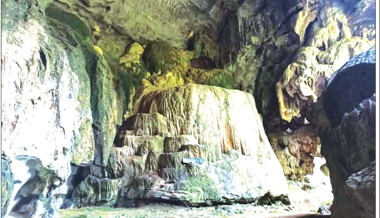
ဘုတ်ပြင်းမြို့နယ်အတွင်းက စိတ်ဝင်စားစရာ တည်ရှိနေသည့် သဘာဝကျောက်လိုဏ်ဂူ။

ဒီသဘာဝလိုဏ်ဂူအနီးမှာတည်ရှိတဲ့ ရတနာပုံကျေးရွာ အနီး ဝန်းကျင်ဟာ သစ်တောတွေထူထပ်ပြီး လူနေလည်းကျပ်းတဲ့အတွက် တိတ်ဆိတ်ငြိမ်းချမ်းနေပါတယ်။ ဘုတ်ပြင်းမြို့နယ်အတွင်းမှာ ဒီလို သဘာဝလိုဏ်ဂူတွေတည်ရှိနေတာဟာ ထူးခြားပြီး ဘူမိအနေအထား အရ စိတ်ဝင်စားဖို့လည်းကောင်းပါတယ်။ ကျောက်တောင်လိုဏ်ဂူ