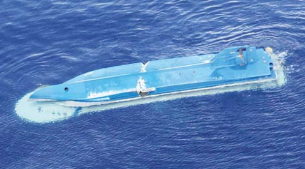
ရုရှားသင်္ဘောနှင့် တိုက်မိပြီးနောက် တိမ်းမှောက်သွားသော ဂျပန် ငါးဖမ်းသင်္ဘောကို တွေ့ရစဉ်။

တိုကျို မေ ၂၆ ဂျပန်ငါးဖမ်းသင်္ဘောတစ်စင်းသည် ရုရှားသင်္ဘောတစ်စင်းနှင့် ဂျပန်နိုင်ငံ မြောက်ဘက်စွန်း ဟော့ကိုင်းဒိုးကျွန်းတွင် မေ ၂၆ ရက်က တိုက်မိ