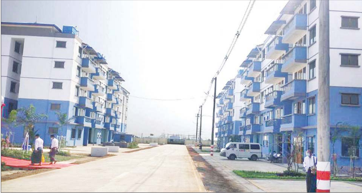
ဒဂုံမြို့သစ်ဆိပ်ကမ်းမြို့နယ်ရှိ မြန်မာနိုင်ငံဝန်ထမ်းအငှားအိမ်ရာကို တွေ့ရစဉ်။