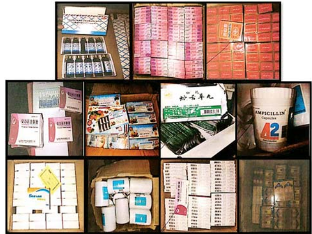
တရားဝင် စာရွက်စာတမ်း အထောက်အထား တစ်စုံတစ်ရာ တင်ပြနိုင်ခြင်းမရှိသည့် တရုတ်နှင့် ထိုင်းစာတန်းပါ ဆေးဝါးမျိုးစုံ။