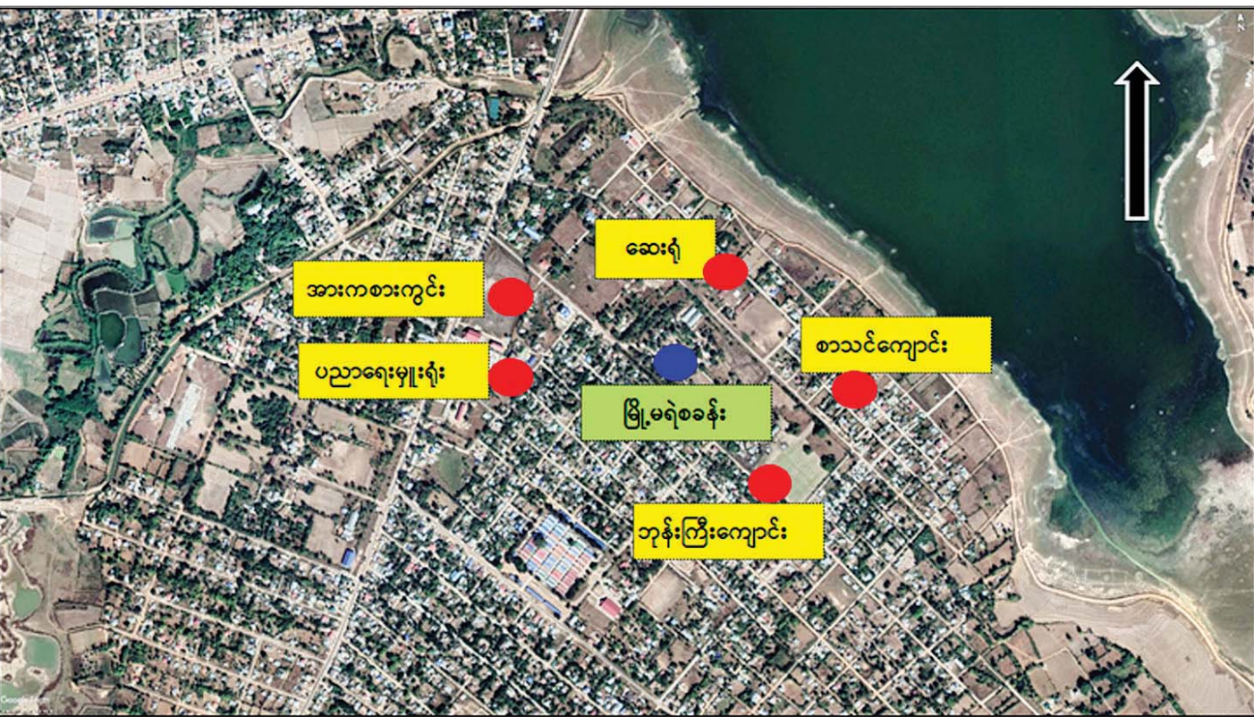
ဒီးမော့ဆိုမြို့မရဲစခန်းအား လက်နက်ကိုင်သောင်းကျန်းသူနှင့် ဆူပူသောင်းကျန်းသူ ပူးပေါင်းအဖွဲ့များက လူနေအိမ်များ၊ အုပ်ချုပ်မှုအဆောက်အအုံများနှင့် ဘာသာရေးအဆောက်အအုံများကို အကာအကွယ်ပြု၍ လာရောက်တိုက်ခိုက်မှုဖြစ်ပေါ်ခဲ့သည်။

တစ်ချိန်တည်းတွင် မိုးဗြဲမြို့၏ အရှေ့ဘက် ကီလို