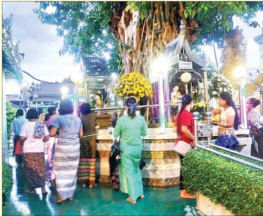
စမ်းချောင်းမြို့နယ် အတုလာဓိပတိမဟာမုနိသကျကိုးထပ်ကြီးဘုရားရင်ပြင်ရှိ ဗောဓိညောင်ပင်၌ ဘုရားဖူးလာကြသူများ ညောင်ရေသွန်းလောင်းပူဇော်နေကြစဉ်။