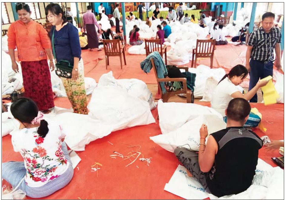
ကွတ်ခိုင်မြို့နယ် ဆန္ဒမဲလက်မှတ် မြေပြင်စစ်ဆေးမှု မှတ်တမ်းဓာတ်ပုံ။