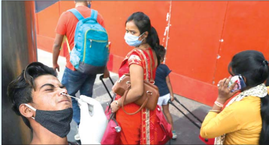
အိန္ဒိယနိုင်ငံ နယူးဒေလီတွင် ကျန်းမာရေးဝန်ထမ်းတစ်ဦးက ကိုဗစ်-၁၉ စစ်ဆေးရန် တို့ဖတ်နမူနာရယူနေသည်ကိုတွေ့ရစဉ်။

အာရှ-ပစိဖိတ်နိုင်ငံများတွင် မေ ၂၅ ရက်က ကိုဗစ်-၁၉ ထပ်မံကူးစက်ဖြစ်ပွားမှုများနှင့် သေဆုံးမှုများ ပိုတိုးလာကြောင်း အတည်ပြုဖော်ပြမှုနှင့်အတူ ယင်းအပေါ် နီးကြားသတိအမြဲရှိနေကြသည်။