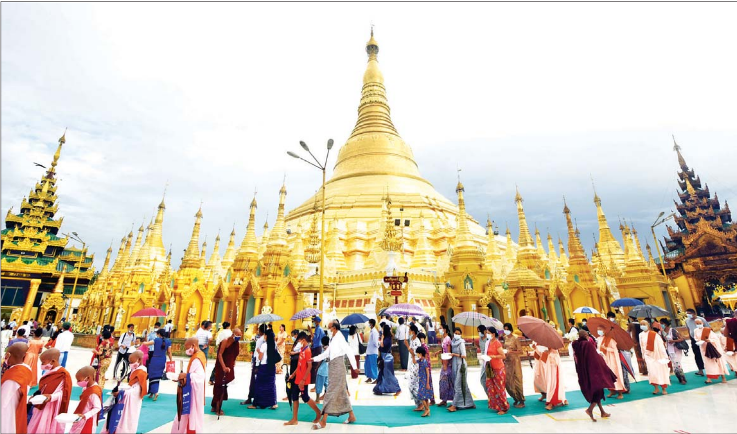
ကဆုန်လပြည့်နေ့(ဗုဒ္ဓနေ့)တွင် ရန်ကုန်မြို့ရှိ ရွှေတိဂုံစေတီတော်မြတ်ကြီး၌ ဘုရားဖူးလာပြည်သူများဖြင့် စည်ကားလျက်ရှိသည်ကို တွေ့ရစဉ်။

ရွှေတိဂုံစေတီတော် ဘဏ္ဍာထိန်း ဂေါပကအဖွဲ့၏ ဩဝါဒါစရိယ ဆရာ တော်ကြီးများထံမှ ဩဝါဒခံယူပွဲနှင့် စာမျက်နှာ ၉ ကော်လံ ၁ ၀