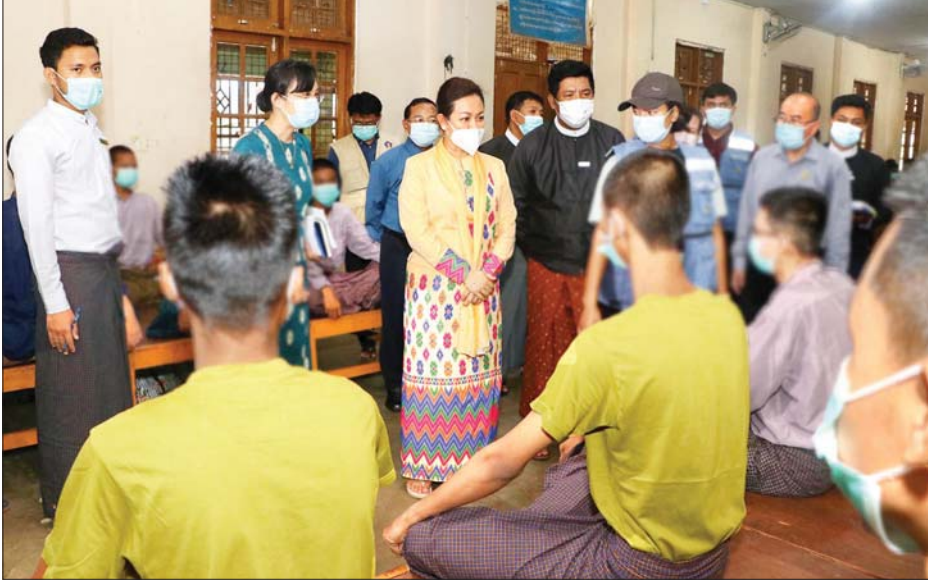
ရောင်းချမည့် အရောင်းဆိုင်ပြန်လည်ဖွင့်လှစ်နိုင်ရေး ပြင်ဆင်ဆောင်ရွက်ထားရှိမှုများ၊ အမျိုးသမီး သက်မွေးအတတ်ပညာသင်ကျောင်း (ရန်ကုန်)တွင် အကြမ်းဖက်ခံရသူ အမျိုးသမီးများကို တစ်နေရာ တည်းတွင် ဝန်ဆောင်မှုပေးသည့်စင်တာ (One Stop Women Support Center- OSWSC)ကို ဖွင့်လှစ်ထားရှိပြီး အကြမ်းဖက်ခံရသူ အမျိုးသမီး များအား လက်ခံစောင့်ရှောက်ကာ ကျန်းမာရေး

လူမှုဝန်ထမ်း၊ ကယ်ဆယ်ရေးနှင့် ပြန်လည်နေရာ ချထားရေးဝန်ကြီးဌာန ပြည်ထောင်စုဝန်ကြီး ဒေါက်တာသက်သက်ခိုင်သည် ယနေ့နံနက်ပိုင်းတွင် သန်လျင်မြို့နယ်ရှိ သန်လျင်လူငယ်သင်တန်းကျောင်း သို့ ရောက်ရှိရာ ခရိုင်အဆင့် ဌာနဆိုင်ရာများနှင့် သင်တန်းကျောင်းတာဝန်ခံတို့က လုပ်ငန်းများ ဆောင်ရွက်နေမှုကို ရှင်းလင်းတင်ပြပြီး ပြည်ထောင်စု ဝန်ကြီးက လိုအပ်သည်များကို မှာကြားသည်။