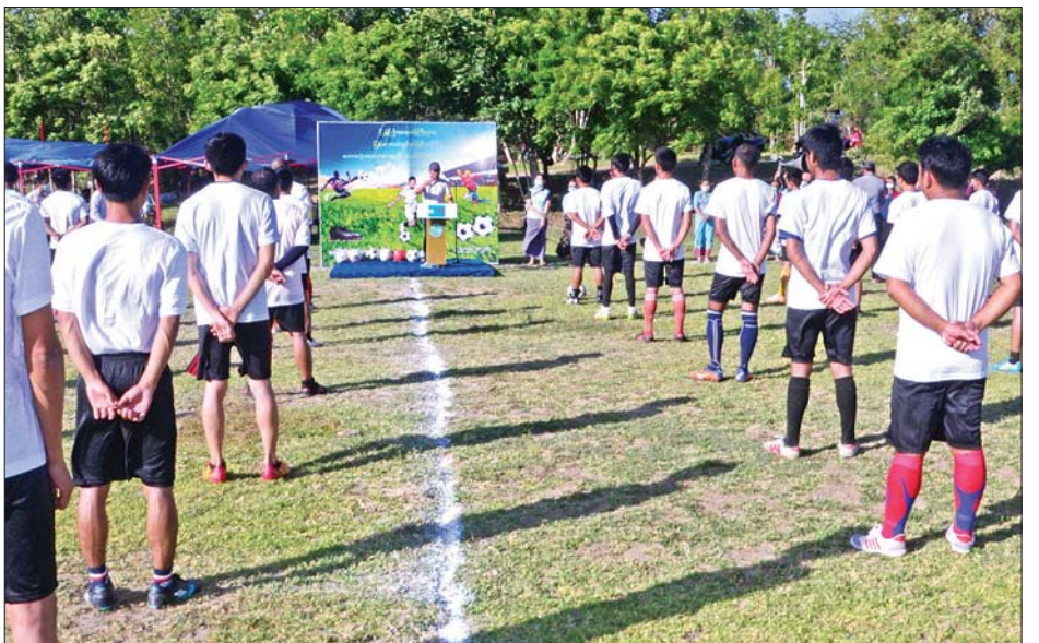
ကာ ရက်သတ္တပတ် သုံးပတ်ကြာမြင့်မည် ဖြစ်သည်။ ဖလား အမျိုးသား/အမျိုးသမီး ဘောလုံးပြိုင်ပွဲကို ဆက်လက်၍ ၂၀၂၁ ခုနှစ် ညွှန်ကြားရေးမှူးချုပ် ကျင်းပမည်ဖြစ်ကြောင်း သိရသည်။ သတင်းစဉ်