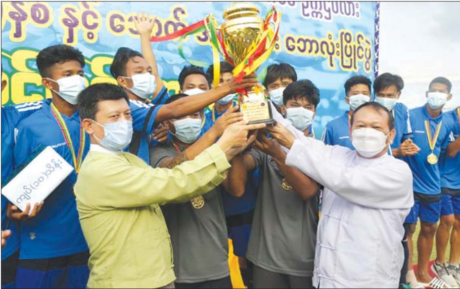
တိုင်းဒေသကြီးစီမံအုပ်ချုပ်ရေးကောင်စီဥက္ကဋ္ဌ ဦးလှစိုး အရှေ့ပိုင်းခရိုင်အသင်းအား တံခွန်စိုက်ဆုဖလား ချီးမြှင့်စဉ်။

ထို့နောက် ဆုပေးပွဲအခမ်းအနားကိုကျင်းပရာ ပွဲစဉ်တစ်လျှောက် အကောင်းဆုံးရှေ့တန်း၊ နောက်တန်း၊ အလယ်တန်း၊ ဂိုးသမားဆု၊ အကောင်းဆုံးကစားသမားဆု ရရှိကြသူများကို အားကစားနှင့် ကာယပညာသိပ္ပံ (ရန်ကုန်) ကျောင်းအုပ်ကြီး၊ တိုင်းဒေသကြီး စီမံအုပ်ချုပ်