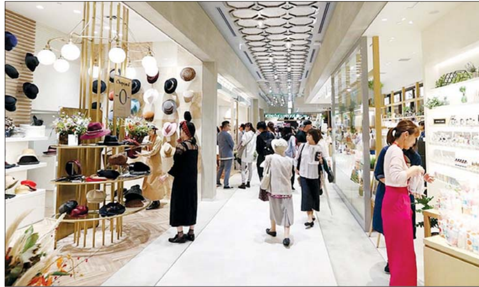
ဂျပန်နိုင်ငံမှ ကုန်တိုက်ကြီးတစ်ခုကို တွေ့ရစဉ်။

ပြောသည်။ ထိုစဉ်က ဂျပန်နိုင်ငံတွင် ပထမဆုံး ကိုဗစ်-၁၉ အရေးပေါ် ကာလအဖြစ် ကြေညာထားသည့် အတွက် ဈေးဆိုင်များမှာ စောစော ပိတ်ရပြီး ယာယီပိတ်ထားရမှုများ လည်းရှိသည့်အတွက် ရောင်းအား မှာ ကျဆင်းခဲ့ရသည်။ ကပ်ရောဂါ မတိုင်မီ နှစ်နှစ်ခန့်အချိန်ကနှင့် နှိုင်းယှဉ်ကြည့်ပါက ရောင်းအားမှာ ၂၈ ရာခိုင်နှုန်း ကွာခြားနေဆဲ ဖြစ်သည်။