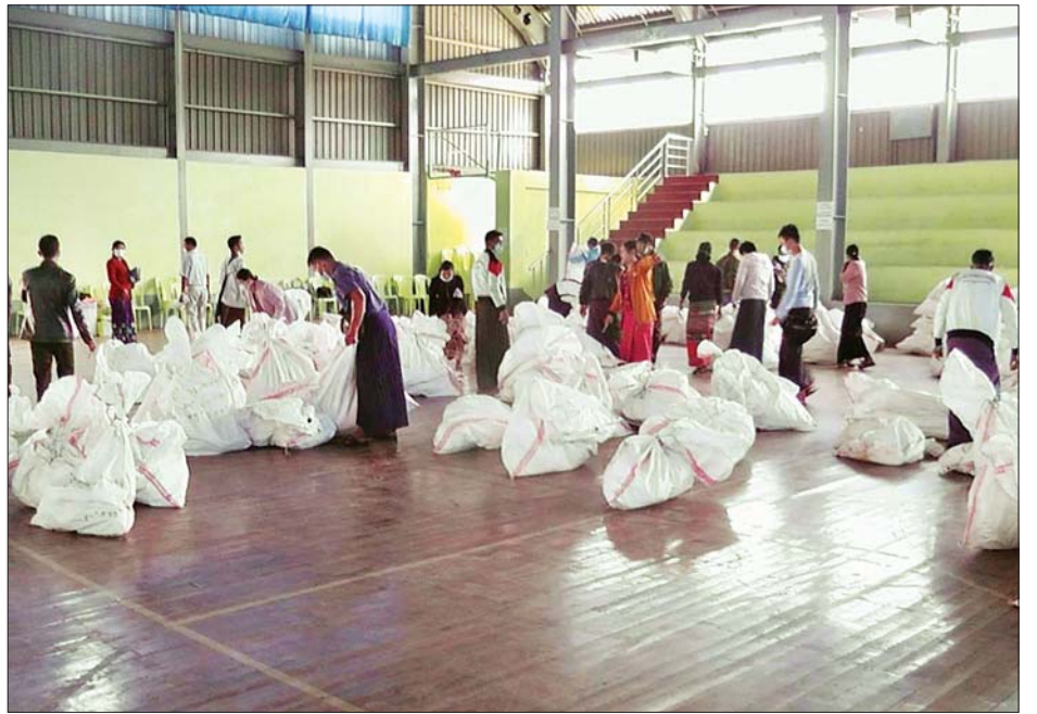
ဆီဆိုင်မြို့နယ် ဆန္ဒမဲလက်မှတ် မြေပြင်စစ်ဆေးမှု မှတ်တမ်းဓာတ်ပုံ။