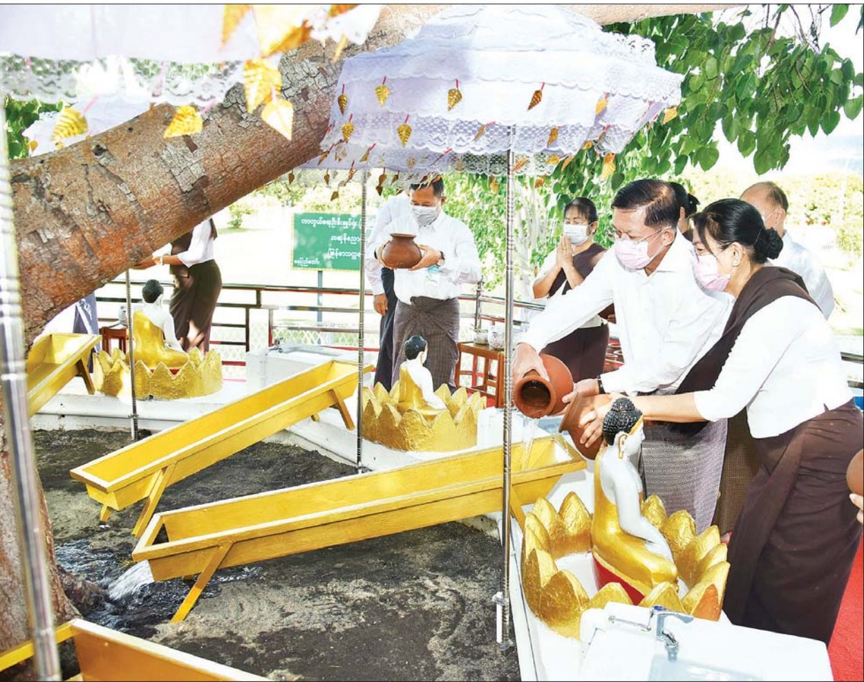
နိုင်ငံတော်စီမံအုပ်ချုပ်ရေးကောင်စီဥက္ကဋ္ဌ၊ တပ်မတော်ကာကွယ်ရေးဦးစီးချုပ် ဗိုလ်ချုပ်မှူးကြီး မင်းအောင်လှိုင်နှင့် ဇနီး ဒေါ်ကြူကြူလှတို့ ဇေယျာသီရိမြို့နယ် လောကချမ်းသာဆုတောင်းပြည့်အသင်းဘုရားကြီးရှိ မဟာဗောဓိညောင်ပင်၌ ကဆုန်ညောင်ရေသွန်းလောင်းပူဇော်စဉ်။

ညောင်ပင်များအား ညောင်ရေသွန်းလောင်းပူဇော်ရန် နေရာယူကြရာ အခမ်းအနားမှူးက မဟာဗောဓိ ရုက္ခသိပ္ပံနပူဇော်ဂါထာတော်ကို ရွတ်ဖတ်ပူဇော်ပြီး သတ်မှတ်ထားသည့် နေရာများအလိုက် မဟာဗောဓိညောင်ပင်များအား ညောင်ရေသွန်းလောင်းပူဇော်၍ အမွှေးနံ့သာရည်များ ပက်ဖျန်းပူဇော်ကြကာ မဟာဗောဓိညောင်ပင်များအား လက်ယာရစ် လှည့်လည်ပူဇော်ကြသည်။ ထို့ပြင် ဇေယျာသီရိမြို့နယ် လောကချမ်းသာဆုတောင်းပြည့်အသင်းဘုရားကြီးရှိ မဟာဗောဓိညောင်ပင်များကိုလည်း နိုင်ငံတော် စီမံအုပ်ချုပ်ရေးကောင်စီဥက္ကဋ္ဌ၊ တပ်မတော်ကာကွယ်ရေးဦးစီးချုပ်နှင့်ဇနီး အမှူးပြုသည့် ကာကွယ်ရေးဦးစီးချုပ်ရုံး(ကြည်း၊ ရေ၊ လေ) မိသားစုများက ကဆုန်ညောင်ရေသွန်းလောင်း ပူဇော်ခဲ့ကြသည်။ ဒီပက်ရာ မြတ်စွာဘုရားက ဂေါတမ ဘုရားအလောင်းတော် သုမေဓာရှင်ရသေ့အား “ဘဒ္ဒကမ္ဘာတွင် ဘုရားအဖြစ်ကို ရလိမ့်မည်ဟု” ဗျာဒိတ်တော်စကား မိန့်ကြားတော်မူသောနေ့၊ ဘုရားအလောင်းတော် သိဒ္ဓတ္ထမင်းသား ဖွားမြင်သောနေ့၊ ဘုရားအဖြစ်ကို ရတော်မူသောနေ့၊ မြတ်စွာဘုရား