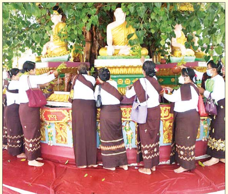
မရမ်းကုန်းမြို့နယ် အပရာဇိတဆံတော်ရှင် ကျိုက်ဝိုင်းစေတီတော်မြတ်ကြီးရှိ ဗောဓိ ညောင်ပင်၌ ဝတ်အသင်းအဖွဲ့များ ညောင်ရေသွန်းလောင်းပူဇော်နေကြစဉ်။ ဓာတ်ပုံ-မျိုးမင်းသိန်း(မရမ်းကုန်း)