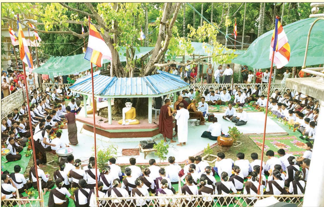
ရခိုင်ပြည်နယ် မောင်တောမြို့ အမှတ်(၄) မြို့မအရှေ့ရပ်ကွက် ဗဟိုဘုန်းတော်ကြီးကျောင်းဝင်းအတွင်း၌ ကဆုန် ညောင်ရေသွန်းလောင်းပွဲတော်ကို စည်ကားသိုက်မြိုက်စွာ ကျင်းပစဉ်။