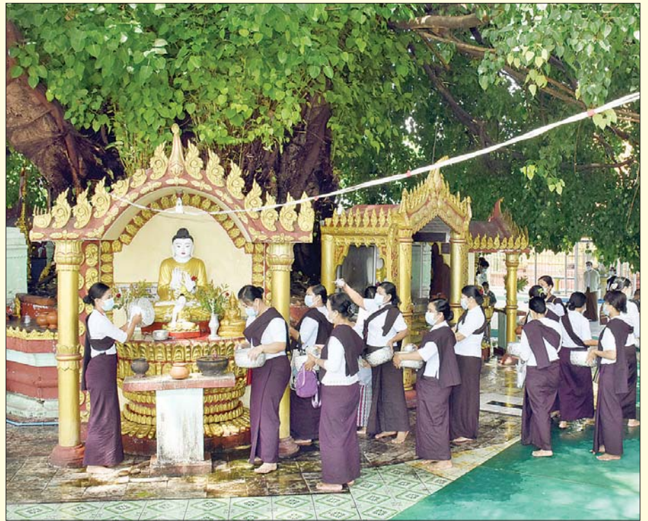
မြစ်ကြီးနားမြို့ လောကမာရ်အောင် ဆုတောင်းပြည့်စေတီတော်ဝင်းအတွင်းရှိ ဗောဓိညောင်ပင်အား ဝတ်အသင်းအဖွဲ့များနှင့် ဒေသခံပြည်သူများ ညောင်ရေသွန်းလောင်း ပူဇော်နေကြစဉ်။