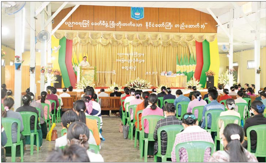
ဒီဂရီကောလိပ်မှ အရည်အသွေးပြည့်ဝသော ဆရာ ဆရာမများ ပြုစုပေးပို့ထားသော ပေးနိုင်ရေးအတွက် လိုအပ်ချက်များကို ပေါင်းစပ်

ပညာရေးဝန်ကြီးဌာန ပြည်ထောင်စုဝန်ကြီး ဒေါက်တာညွန့်ဖေသည် ဒုတိယဝန်ကြီး ဦးဇော်ဝင်းနှင့် အတူ ယနေ့နံနက် ၁၁ နာရီတွင် ကလောမြို့နယ် အမှတ်(၁) အခြေခံပညာအထက်တန်းကျောင်းသို့ ရောက်ရှိပြီး အဆိုပါကျောင်းရှိ တေဇခန်းမ၌ ကလောမြို့နယ် ပညာရေးမိသားစု၊ ဆရာ ဆရာမများနှင့် တွေ့ဆုံသည်။ (ယာပုံ)