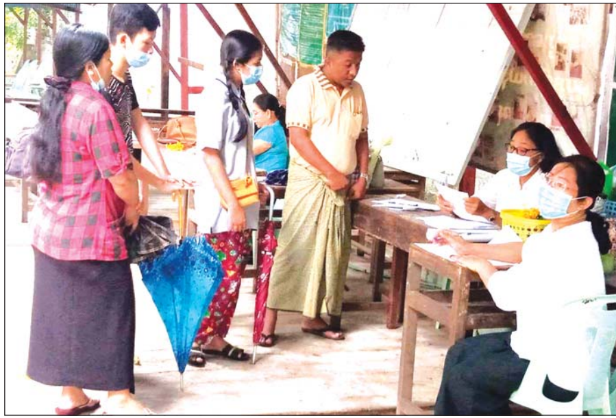
၂၀၂၁-၂၀၂၂ ပညာသင်နှစ်အတွက် ကျောင်းအပ်နှံမှုကို တွေ့ရစဉ်။

ပညာရေးဝန်ကြီးဌာန အခြေခံပညာ ဦးစီးဌာနသည် လာမည့် ၂၀၂၁-၂၀၂၂ ပညာသင်နှစ်အတွက် နိုင်ငံတစ်ဝန်း အခြေခံပညာဦးစီးဌာန အောက်ရှိ ထက်/လယ်/ မူ ကျောင်းများအားလုံးကို မေ ၂၄ ရက်မှ ၃၁ ရက်အထိ ကျောင်းအပ်နှံရေး ရက်သတ္တပတ်အဖြစ် သတ်မှတ်ကြေညာခဲ့ရာ ယနေ့ ကျောင်းအပ်နှံမှု လုပ်ငန်းများကို အခြေခံပညာ ကျောင်းများအားလုံး စတင်လက်ခံခဲ့ကြသည်။ ယင်းသို့ စတင်လက်ခံရာတွင် မိဘများ၏ စိုးရိမ်ပူပန်အကဲခတ်မှုများကြောင့် ယနေ့စတင်လက်ခံသည့်နေ့တွင် ယခင်နှစ်များကဲ့သို့ ကျိတ်ကျိတ်တိုး မရှိခဲ့သော်လည်း အခြေခံပညာကျောင်း အသီးသီးတွင် လာရောက် အပ်နှံမှုများရှိခဲ့ပြီး ယင်းသို့ အပ်နှံရာတွင် မေ ၂၄ ရက်ပထမဆုံး ကျောင်းအပ် လက်ခံသည့်နေ့တွင် ရန်ကုန်တိုင်းဒေသကြီး ထက်/လယ်၊ မူ ကျောင်းအားလုံး ကျောင်းအပ်နှံမှုမှာ