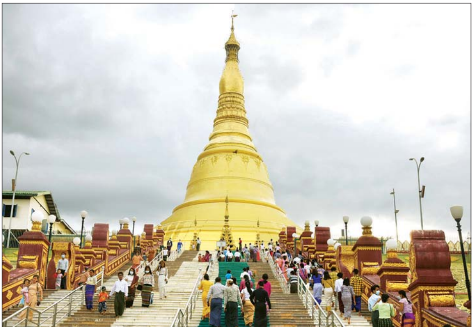
ကဆုန်လပြည့်(ဗုဒ္ဓနေ့)တွင် နေပြည်တော် ဥပုသ်သီလဆောက်တော်မြတ်ကြီးသို့ ဘုရားဖူးလာပြည်သူများဖြင့် စည်ကားနေသည်ကို တွေ့ရစဉ်။

အတူ ဥပုသ်သီလဆောက်တော်မြတ်ကြီးကို ရောက်တိုင်း ဘုရားရင်ပြင်တော်ကို သန့်ရှင်းရေးလုပ်တယ်။ တံမြက်စည်းလှည်းတယ်။ သူငယ်ချင်းတွေနဲ့ စုပေါင်းပြီး အချိုရည်၊ အအေး စတဲ့အလှူလည်း လုပ်ဖြစ်တယ်။ ဒီနေ့မနက်ပိုင်းမှာ မဟာသကျရံသီရပ်ရှင်တော်မြတ်ကြီးနဲ့ ဗုဒ္ဓဂယာတို့ကို သွားရောက်ဖူးမြော်ပြီးပါပြီ။ ညနေပိုင်းမှာတော့ ထာဝရ ငြိမ်းချမ်းရေးစေတီကို သွားဖူးပါမယ်။ မြန်မာနိုင်ငံအတွင်း နေထိုင်ကြတဲ့ ပြည်သူတွေအားလုံး ကျန်းမာ ချမ်းသာကြပါစေလို့ ဆုတောင်းပါတယ်” ဟုပြောသည်။ “ဒီနေ့က ရုံးပိတ်ရက်လည်း ဖြစ်တော့ ကုသိုလ်ယူကြတာပေါ့။ ကျွန်တော်က မိသားစုနဲ့လာတာပါ။ မနက်ပိုင်း ဘုရားဖူးပြီးရင် နေ့လယ်မှာ ကလေးတွေကို ကစားကွင်းပို့မယ်။ ညနေပိုင်း