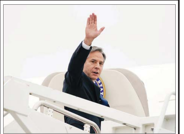
အမေရိကန်နိုင်ငံခြားရေးဝန်ကြီး အန်တိုနီဘလင်ကန်။