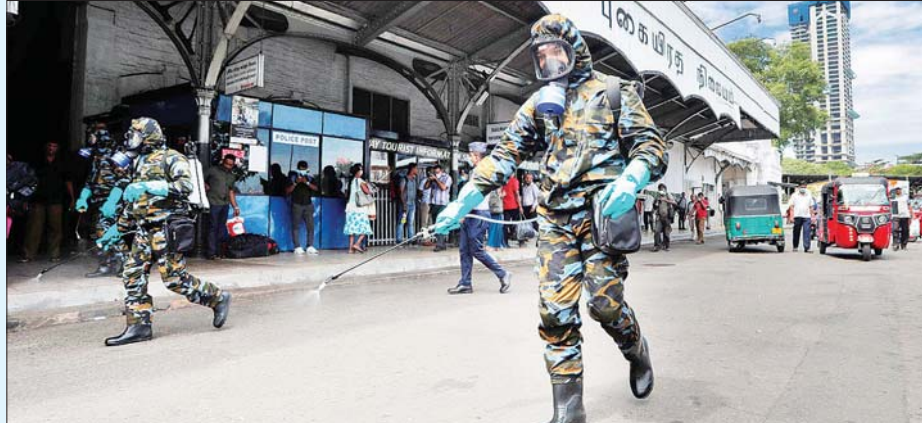
သီရိလင်္ကာတပ်ဖွဲ့ဝင်များ သီရိလင်္ကာနိုင်ငံ ကိုလံဘီယာဆိပ်တွင် ကိုဗစ်-၁၉ ရောဂါ ကာကွယ်ရေး လုပ်ငန်းများ ဆောင်ရွက်စဉ်။