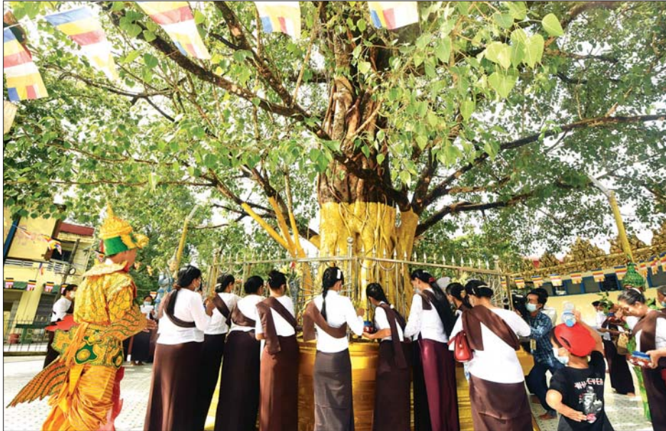
ရန်ကုန်မြို့ သီရိမင်္ဂလာ ကမ္ဘာအေးစေတီတော်မြတ်ကြီးရှိ မဟာဗောဓိပင်၌ ဘာသာရေးဝတ်အသင်းအဖွဲ့နှင့် ဘုရားဖူးလာပြည်သူများက ညောင်ရေသွန်းလောင်းပူဇော်ကြစဉ်။