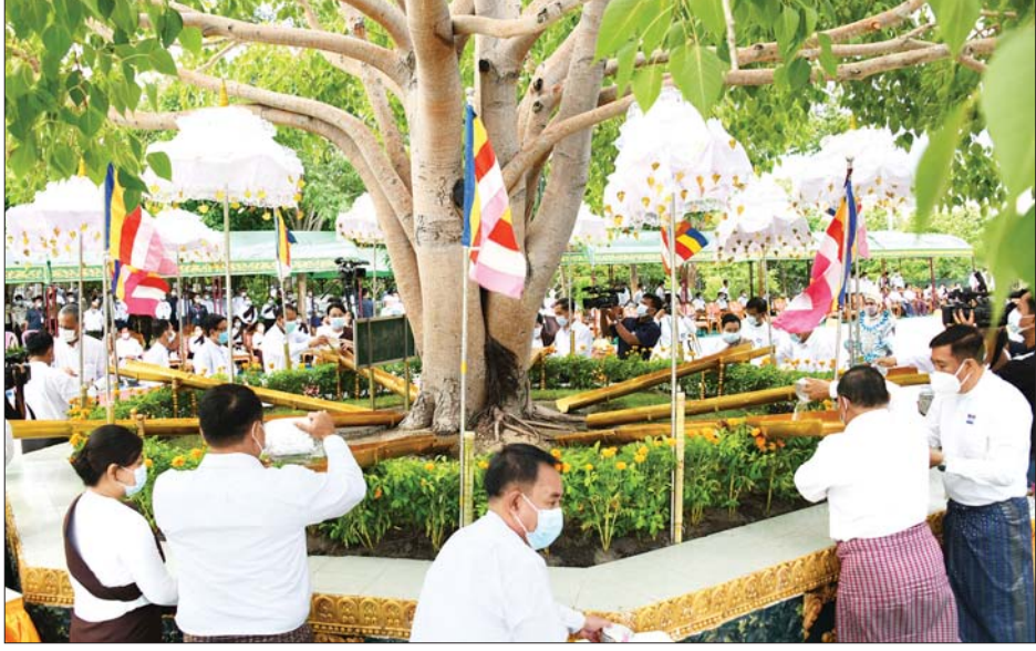
နေပြည်တော်၊ ဥပုတသန္တိစေတီတော်မြတ်ကြီး ပရိဝုဏ်တော် မြောက်ဘက်အရပ်ရှိ မဟာဗောဓိညောင်ပင်ကို ညောင်ရေသွန်းလောင်း ပူဇော်နေကြစဉ်။

ပရိနိဗ္ဗာန် စံတော်မူသောနေ့ စသည့်နေ့များ အားလုံးသည် ကဆုန်လပြည့်နေ့များပင် ဖြစ်သဖြင့် “ဖွားမြင်ပွင့်စံ၊ ဗျာဒိတ်ခံ၊ မှတ်ရန်ကဆုန်၊ လပြည့်ကြို” ဟု လည်းကောင်း၊ “ဗျာဒိတ်ဖွားမြင်ဗောဓိပင်၊ စံဝင်နိဗ္ဗာန်နန်း”ဟု လည်းကောင်း မှတ်တမ်းပြုကြပြီး ကဆုန်လပြည့်ဗုဒ္ဓနေ့ဟူ၍ ဗုဒ္ဓဘာသာဝင်များက အထွတ်အမြတ်ထားခဲ့ကြကြောင်း၊ ကဆုန်လပြည့်နေ့၏ ထူးခြားချက်မှာ ဂေါတမ မြတ်စွာဘုရားသာလျှင် မကဘဲ အခြားနှစ်ကျိပ်ရှစ်ဆူ ကုန်သော မြတ်စွာဘုရားတို့၏ ဖွားမြင်တော်မူသောနေ့၊ ဘုရားဖြစ်တော်မူသောနေ့၊ ပရိနိဗ္ဗာန်ပြုသောနေ့များမှာလည်း ကဆုန်လပြည့်နေ့ပင်ဖြစ်၍ ကဆုန်လပြည့်နေ့ကို “ဗုဒ္ဓနေ့”ဟု သတ်မှတ်ခြင်းဖြစ်ကြောင်း၊ ကဆုန်ညောင်ရေသွန်းပွဲတော်သည် ကုသိုလ်ယူဖွယ်ရာ၊ ဝမ်းသာကြည်နူးဖွယ်ရာ ဘာသာရေးဆိုင်ရာပွဲတော်တစ်ခုဖြစ်သည့် အပြင် မြန်မာ့ယဉ်ကျေးမှုအမွှေအနှစ်တစ်ရပ်အဖြစ် ကျင်းပပြုလုပ် သည့် ပွဲတော်ဖြစ်ကြောင်းနှင့် ကဆုန်လပြည့်နေ့ မတိုင်မီ တစ်ရက်အလိုတွင် ညောင်ရေသွန်းလောင်းကြမည့် ညောင်ပင်များကို အမွှေးနံ့သာရည်များ ပက်ဖျန်းပေးခြင်း၊ မဟာဗောဓိပင်ပလ္လင်တော်အား ကြည်ညိုစဖွယ် ဖြစ်အောင်ပြင်ခြင်း စသည့် ကုသိုလ်ယူဖွယ်များကို ပြုလုပ်လေ့ရှိကြကြောင်း သတင်းရရှိသည်။