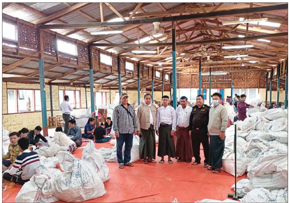
မူဆယ်မြို့နယ် ဆန္ဒမဲလက်မှတ် မြေပြင်စစ်ဆေးမှု မှတ်တမ်းဓာတ်ပုံ။