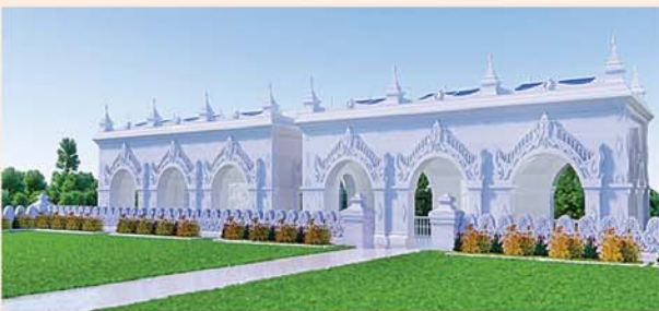
မြန်မာမှုစတုရန်းကျောက်ဖြင့် တည်ဆောက်ပူဇော်ထားသော ဂန္ဓကုဋ်တိုက် (၅၄x၂၇)ပေ ၂၄ လုံး ၁ လုံးလျှင်- ၁၂၅၀ သိန်း