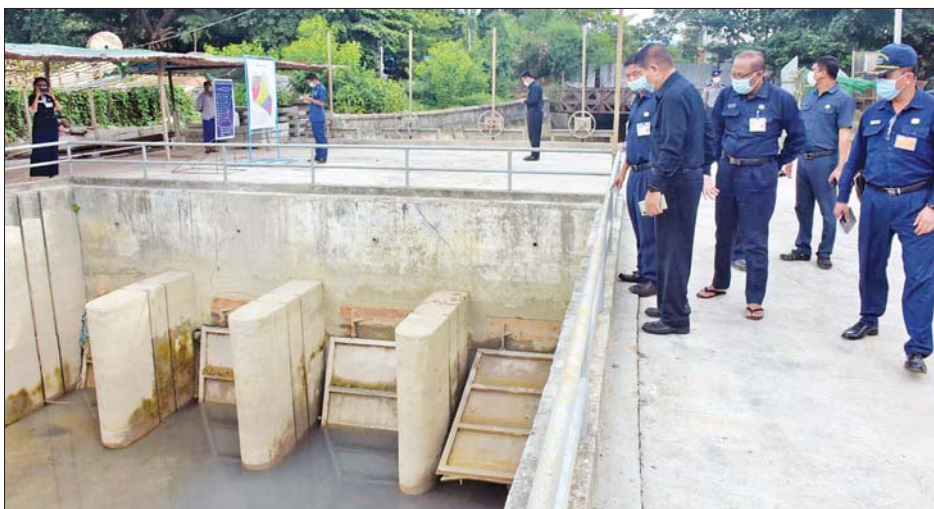
သတင်းစဉ်

အဆိုပါရေမြောင်းသည် စောရန်ပိုင်အရှေ့ရပ်ကွက်နှင့် အနောက်ရပ်ကွက်များမှ ဟာဘီချောင်းတံခါးသို့ရောက်ရှိပြီး ရန်ကုန်မြစ်အတွင်းသို့ စီးဝင်သွားကြောင်း၊ ရန်ကုန်မြစ် ရေတက်ချိန်နှင့် အလုံမြို့နယ်အတွင်း ရေစီးဆင်းမှု အခြေအနေပေါ် မူတည်၍ ဟာဘီချောင်းတံခါးကို အဖွင့် အပိတ်ပြုလုပ် ထိန်းချုပ် ဆောင်ရွက်လျက်ရှိကြောင်း သိရသည်။