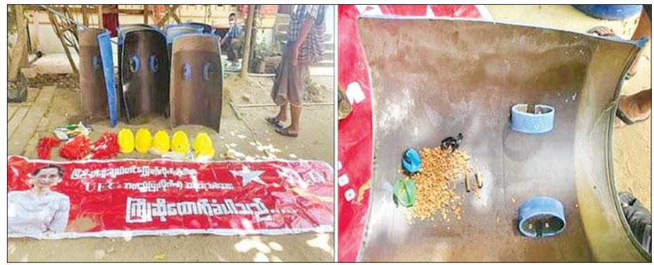
ပျဉ်းမနားမြို့၌ သိမ်းဆည်းရမိသည့် ဆူပူအကြမ်းဖက်ရာတွင် အသုံးပြုသည့်ပစ္စည်းများ။

နာရီခွဲတွင် နေပြည်တော် ပြည်ထောင်စုနယ်မြေ ပျဉ်းမနားမြို့ ရွှေချီရပ်ကွက် (၉)လမ်းရှိ စဉ့်အိုးဘို ဘုန်းကြီးကျောင်းအား သတင်းအရ လုံခြုံရေးတပ်ဖွဲ့ဝင်များပါဝင်သော ပူးပေါင်းအဖွဲ့က သွားရောက်စစ်ဆေးခဲ့ရာ အဆိုပါဘုန်းကြီးကျောင်း အနောက်ဘက် ရေစက်တံနှင့် သိမ်မြေအောက်ခန်းအတွင်းမှ ပြောက်ကျားအင်္ကျီနှစ်ထည်၊ လက်လုပ်ဗုံးနှစ်လုံး၊ ကော်ဒိုင်းခြောက်ချပ်၊ ဖိုက်ဘာဦးထုပ်ငါးလုံးနှင့် အခြားဆက်စပ်ပစ္စည်းများကို တွေ့ရှိသိမ်းဆည်းရမိခဲ့ကြောင်း သိရသည်။ အရေးယူဆောင်ရွက်မည် အဆိုပါဖြစ်စဉ်များမှ ဖမ်းဆီးရမိသူများအား ဥပဒေနှင့်အညီ အရေးယူ ဆောင်ရွက်သွားမည် ဖြစ်ကြောင်းသတင်းရရှိသည်။ သတင်းစဉ်