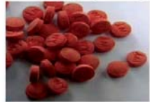
စိတ်ကြွမှုယစ်ဆေးများ

လူငယ်သဘာဝ အသစ်အဆန်းကိုမြင်လျှင် စမ်းသပ်စူးစမ်းလိုစိတ်အား ရောင်းချသူများမှ အခွင့်ကောင်းယူကာ နည်းလမ်းပေါင်းစုံသုံး၍ ဖြားယောင်းတတ်သည်ကို အထူးဂရုပြု၍ စိတ်ကြွမှုယစ်ဆေးဝါးများအား လုံးဝရှောင်ကြဉ်ပါ။