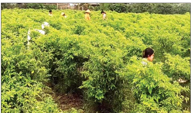
ပျက်သိမ်းပြီး အခြားသီးနှံတစ်မျိုးကို ပြန်လည်စိုက်ပျိုးကြသည်။ ယင်းကျေးရွာများတွင် သီးနှံတစ်မျိုးကို ဧကဝက်ခန့်သာ စိုက်ပျိုး ကြပြီး သီးနှံတစ်မျိုးဈေးမကောင်းပါက အခြားသီးနှံတစ်မျိုးကို အစား ထိုး၍ ဧကနည်းနည်းဖြင့် သီးနှံမျိုးစုံစိုက်ပျိုးကြကြောင်း သိရသည်။ (မြင့်ထွန်းမင်း(ကောလင်း))

အဆိုပါကျေးရွာများတွင် ကုလားအော်ငရုတ်သီးကို အထွက်နှုန်း နည်းပြီး ဈေးမကောင်းသဖြင့် တချို့အခင်းရင်များက စိုက်ခင်းများ