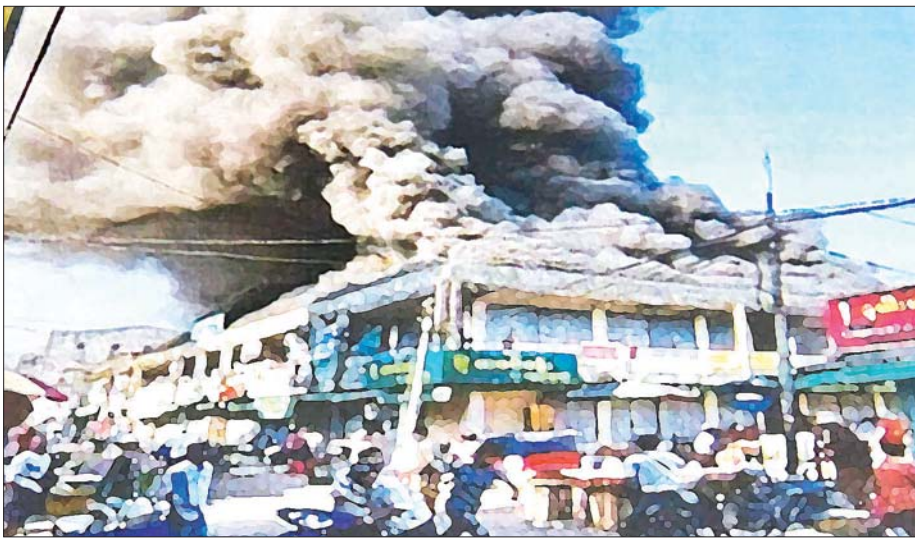
မတရားအသင်းများ ဖြစ်သလို အကြမ်းဖက်အုပ်စုများလည်း ဖြစ်သည်။

တိုင်းပြည်အလုံးစုံ ပျက်သုဉ်းရေးကို ဖန်တီးကြသူများမှာ ယနေ့မတရားအသင်းအဖြစ် ကြေညာထားသော အဖွဲ့အစည်းများဖြစ်သည်။ NLD မှ လွှတ်တော်ကိုယ်စားလှယ်အချို့နှင့် နိုင်ငံရေးအစွန်းရောက်များ ပါဝင်ဖွဲ့စည်းသည့် ပြည်ထောင်စုလွှတ်တော်ကိုယ်စားပြုကော်မတီ (Committee Representing Pyidaungsu Hluttaw-CRPH) နှင့် ၎င်းက ထပ်မံဖွဲ့စည်းထားသော အမျိုးသားညီညွတ်ရေးအစိုးရ (National Unity Government-NUG)၊ ၎င်းမှ ထပ်မံဖွဲ့စည်းသည့် ပြည်သူ့ကာကွယ်ရေးတပ်မတော် (People Defence Force-PDF) ၊ ၎င်းတို့၏ လက်အောက်ခံ အဖွဲ့အစည်းများအားလုံးဖြစ်သည်။ ၎င်းတို့သည် တိုင်းပြည်ကို ဖျက်ဆီးသည့်