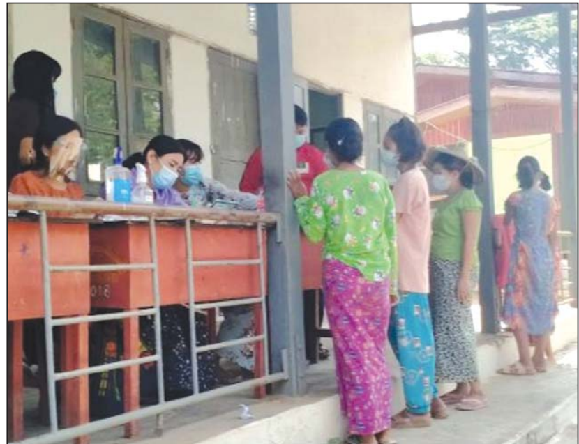
ချင်းရွှေဟော်အထက်၌ လာရောက်ကျောင်းအပ်နေသော ကျောင်းသားမိဘများ

သတ်မှတ်လက်ခံသွားမည်ဖြစ်ကာ ဇွန် ၁ ရက် မှစ၍ ကျောင်းဖွင့်လှစ်သွားမည်ဖြစ်ကြောင်း သိရသည်။ မြို့နယ်(ပြန်/ဆက်)