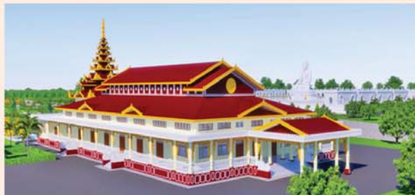
ဓမ္မာရုံ(၂၀၃x၉၀)ပေ ၁ လုံး-၈၇၀၀ သိန်း