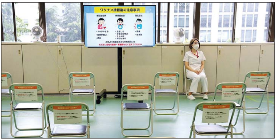
ကာကွယ်ဆေးထိုးစဉ် ဘေးထွက်ဆိုးကျိုးများဖြစ်ပေါ်ပါက ကုသပေးရန်စောင့်ဆိုင်းနေသည့်သူနာပြုတစ်ဦးကို တွေ့ရစဉ်။

မကြာမီအချိန်အတွင်း ကာကွယ်ဆေးထိုးနိုင်မှုကို နှစ်ဆတိုးသွားမည်ဟုလည်း အစိုးရက ပြောသည်။ ကာကွယ်ဆေးထိုးပြီး ပြန်လာသည့် အမျိုးသားတစ်ဦးက ကာကွယ်ဆေးပထမအကြိမ် ထိုးခြင်းဖြစ်ပြီး ချောမွေ့စွာ ပြီးဆုံးသွားသည်ဟု