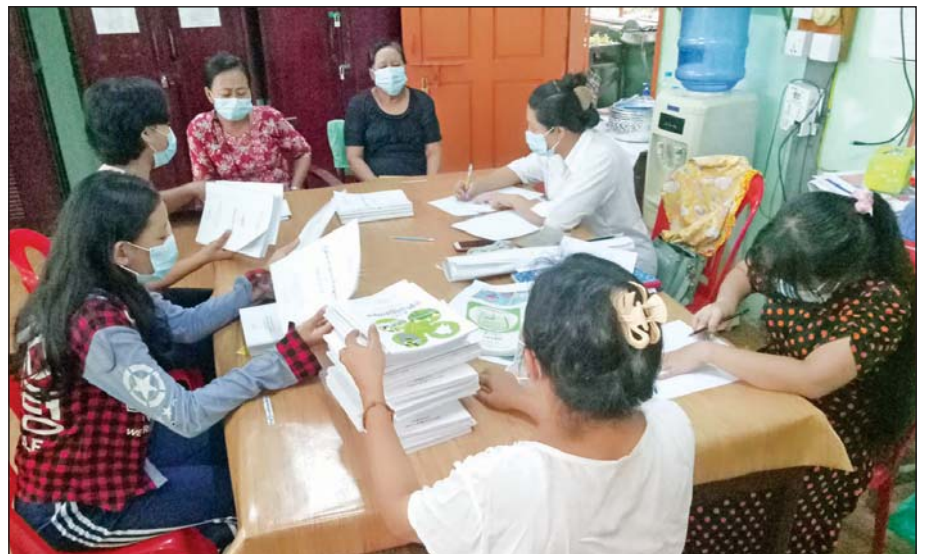
တာမွေမြို့နယ်၌ ကျောင်းလာရောက်အပ်နှံမှုကို တွေ့ရစဉ်။ သတင်းစဉ်