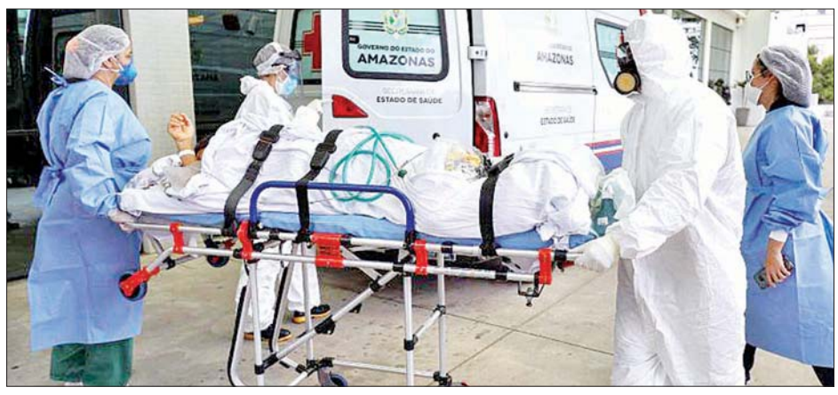
ဘရာဇီးနိုင်ငံတွင် ကိုဗစ်-၁၉ ရောဂါသည်တစ်ဦးအား ရွှေ့ပြောင်းသယ်ယူနေသည်ကို တွေ့ရစဉ်။

ဂျပန်နိုင်ငံတွင် ကိုဗစ်-၁၉ ကူးစက်ဖြစ်ပွားမှု တစ်ရက်ပြီးတစ်ရက် ကျဆင်း တိုကျို မေ ၂၄ ဂျပန်နိုင်ငံ တိုကျိုမြို့တွင် မေ ၂၄ ရက်က ကိုဗစ်-၁၉ ထပ်မံ ကူးစက်ဖြစ်ပွားသူ ၃၄၀ ရှိ ကြောင်း အစိုးရက အတည်ပြု ဖော်ပြခဲ့သည်။ အဆိုပါ ပမာဏသည် လွန်ခဲ့သောသီတင်းပတ်ကထက် ၇၉ ဦး လျော့နည်းခဲ့သည်။ နေ့စဉ် ကိုဗစ်-၁၉ ကူးစက် ဖြစ်ပွားမှုသည် ၁၁ ရက် ဆက်တိုက်ကျဆင်းခဲ့သည်။ ဧပြီ ၁၂ ရက်မှစကာ ယခု အတည်ပြု ဖော်ပြလိုက်သော ကိုဗစ်-၁၉ ကူးစက်ဖြစ်ပွားမှု ပမာဏသည် ပထမဆုံးအကြိမ်အဖြစ် ၄၀၀ အောက် ကျဆင်းခဲ့သည်။ အင်န်အိတ်ချီကေ