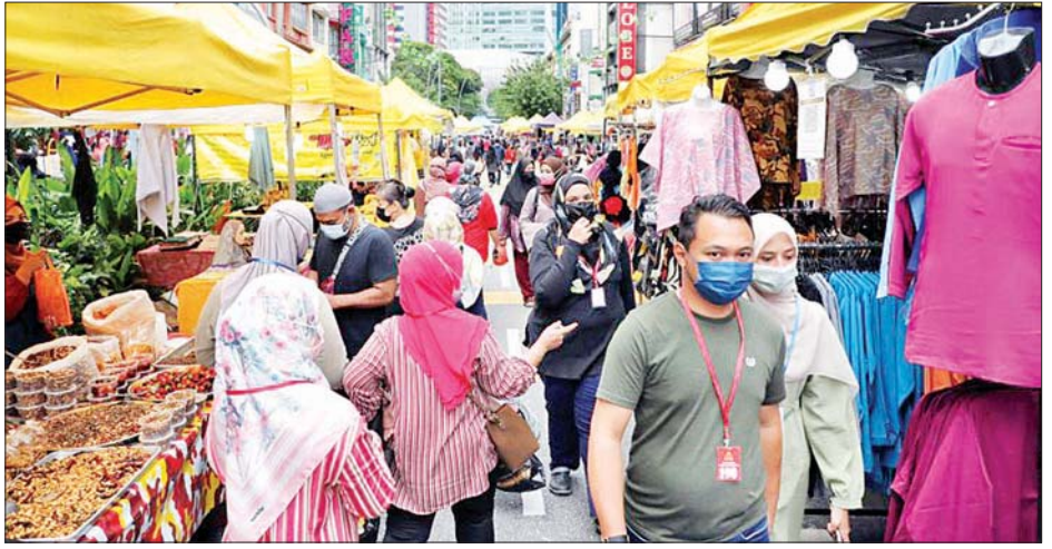
မလေးရှားနိုင်ငံ ကွာလာလမ်ပူမြို့ရှိ လမ်းဘေးဈေးဆိုင်တန်းတစ်ခုကို ဖြတ်သန်းပြီး ပြည်သူများ နှာခေါင်းစည်းတပ်ဆင်ကာ သွားလာနေသည်ကို တွေ့ရစဉ်။

ကာလာလမ်ပူ မေ ၂၄ မလေးရှားနိုင်ငံတွင် မေ ၂၄ ရက် က တစ်နေ့အတွင်း ကိုဗစ်-၁၉ နေ့စဉ်ကူးစက်ဖြစ်ပွားမှု ၆၉၇၆ ဦးဖြင့် ကိုဗစ်-၁၉ ကူးစက်ဖြစ်ပွား မှု အမြင့်ဆုံး စံချိန်တင်ခဲ့သည်။ ကိုဗစ်-၁၉ ကူးစက်ဖြစ်ပွားမှု ကို တုံ့ပြန်သောအားဖြင့် အစိုးရ သည် တင်းကျပ်သော ကန့်သတ် ပိတ်ဆို့မှုများကို ချမှတ်ရန် ဆုံးဖြတ်ခဲ့သည်။ ကိုဗစ်-၁၉ ကန့်သတ်ပိတ်ဆို့ မှုသစ်များတွင် အစိုးရဝန်ထမ်း ၈၀ ရာခိုင်နှုန်းနှင့် ပုဂ္ဂလိကကဏ္ဍ များတွင် လုပ်ကိုင်နေသော အလုပ် သမား ၄၀ ရာခိုင်နှုန်း အိမ်မှ အလုပ်လုပ်ရန် ပါဝင်သည်။ ပြည်သူ့ သယ်ယူပို့ဆောင်ရေး လုပ်ငန်းများကိုလည်း ထက်ဝက် လျော့ချလိုက်ပြီး ပြေးဆွဲချိန်များ ကိုလည်း နာရီလျှော့ချလိုက်သည်။ အဆိုပါ ကိုဗစ်-၁၉ ကန့်သတ် ပိတ်ဆို့မှုသည် များသော အားဖြင့် ကြာမြင့် မည်ဖြစ်ကြောင်း သိရသည်။ မလေးရှားနိုင်ငံသည် ယခုလ အစောပိုင်းတွင် တစ်နိုင်ငံလုံး ကန့်သတ်ပိတ်ဆို့မှု ချမှတ်ထား သည်။ ကျောင်းများကိုလည်း ပိတ်ထားပြီး ပြည်သူများကိုလည်း ပြည်နယ်နှင့် ဒေသများသို့ ခရီး သွားလာခြင်း မပြုလုပ်ရန် တားမြစ်ထားသည်။ ဝန်ကြီးချုပ် မူယစ်ဒင် ယက်ဆင်က မေ ၂၄ ရက်က နိုင်ငံပိုင် အသံလွှင့်ဌာနက ထုတ်လွှင့်သော တွေ့ဆုံမေးမြန်း ခန်းတွင် အကယ်၍ အစိုးရအနေ ဖြင့် စီးပွားရေးကဏ္ဍ အပါအဝင် အလုံးစုံ ကန့်သတ်ပိတ်ဆို့မှု ပြုလုပ်ခဲ့မည်ဆိုပါက နိုင်ငံ၏ စီးပွားရေး ပြိုလဲသွားမည့်