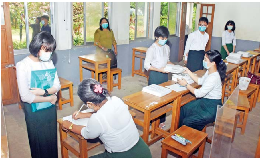
အလုံမြို့နယ်၌ ကျောင်းသား ကျောင်းသူများ ကျောင်းအပ်နှံကြစဉ်။ သတင်းစဉ်