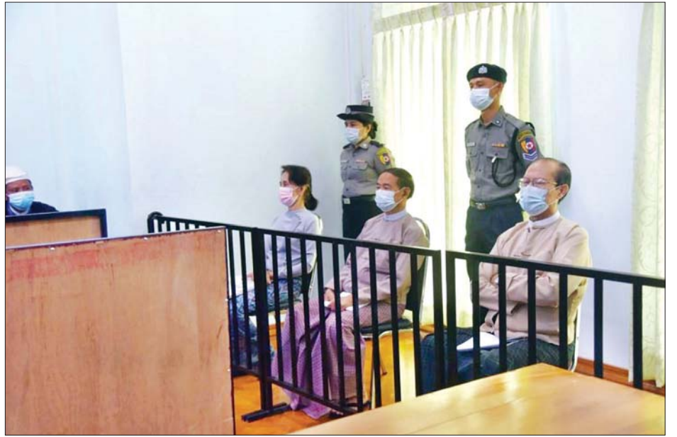
နိုင်ငံတော်သမ္မတဟောင်း ဦးဝင်းမြင့်၊ နိုင်ငံတော်၏ အတိုင်ပင်ခံပုဂ္ဂိုလ်ဟောင်း ဒေါ်အောင်ဆန်းစုကြည်နှင့် နေပြည်တော်ကောင်စီဥက္ကဋ္ဌဟောင်း ဒေါက်တာမျိုးအောင်တို့အပေါ် စွဲဆိုထားသည့်အမှုများကို သီးသန့်တရားရုံး၌ တရားစီရင်ရေးလုပ်ငန်းများ စတင်ဆောင်ရွက်စဉ်။