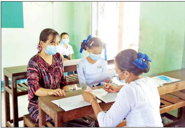
မော်လမြိုင်မြို့နယ်၌ ကျောင်းလာရောက်အပ်နှံမှုကို တွေ့ရစဉ်။ မြို့နယ်(ပြန်/ဆက်)