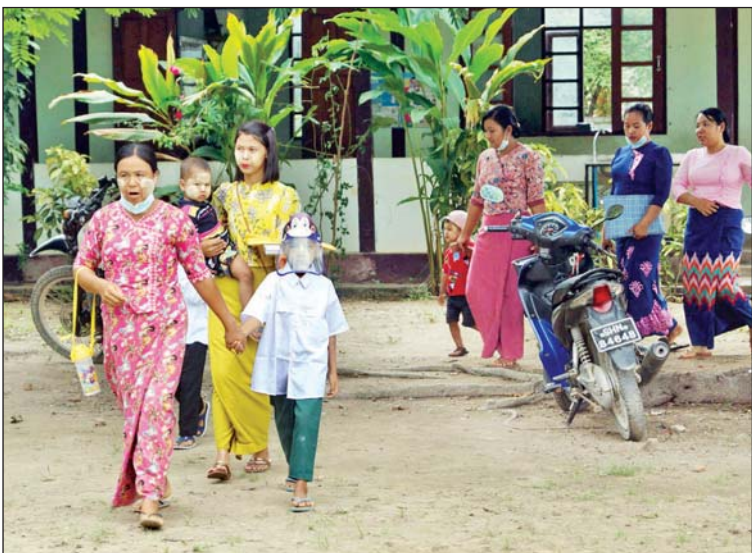
မိုင်းဆတ်မြို့နယ်၌ ကျောင်းအပ်နှံရန် လာရောက်ကြသူများကို တွေ့ရစဉ်။