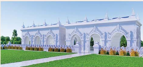
မြန်မာမှုတော်ကျောက်မြင့် တည်ဆောက်ပူဇော်ထားသော ဂန္ဓကုဋ်တိုက် (၅၄x၂၇)ပေ ၂၄ လုံး ၁ လုံးလျှင်- ၁၂၅၀ သိန်း