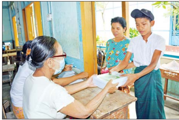
မိုးမိတ်မြို့နယ်၌ ကျောင်းသားတစ်ဦး ကျောင်းအပ်နှံစဉ်။ ခရိုင်(ပြန်/ဆက်)