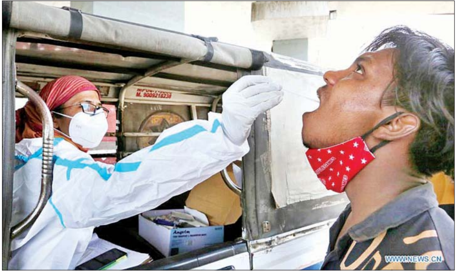
အိန္ဒိယနိုင်ငံ ပိုပေါလ်မြို့တွင် ကျန်းမာရေးဝန်ထမ်းတစ်ဦး ကိုဗစ်-၁၉ စစ်ဆေးရန် တို့ဖတ်နမူနာ ရယူနေသည်ကို တွေ့ရစဉ်။

အမေရိကန်ပြည်ထောင်စုနှင့် ဘရာဇီးနိုင်ငံပြီး နောက် ကိုဗစ်-၁၉ ဖြင့် သေဆုံးသူ သုံးသိန်းကျော် လွန်လာသည့်နိုင်ငံမှာ အိန္ဒိယနိုင်ငံဖြစ်သည်။ လွန်ခဲ့သော ၂၄ နာရီအတွင်း နောက်ထပ်သေဆုံးသူ ၄၄၅၄ ဦး ထပ်တိုးလာခဲ့ရာ ယင်းပမာဏသည် သတ်မှတ်ကာလအတွင်း အိန္ဒိယနိုင်ငံ၌ ကိုဗစ်-၁၉ ဖြင့် သေဆုံးခဲ့သည့် အမြင့်ဆုံးပမာဏဖြစ်သည်။ ထို့အပြင် အိန္ဒိယနိုင်ငံအတွင်း ကိုဗစ်-၁၉ ကူးစက်ဖြစ်ပွားသူ ၂၆၇၅၄၄၄ ဦးရှိသည်။ ဆင်ပွာ