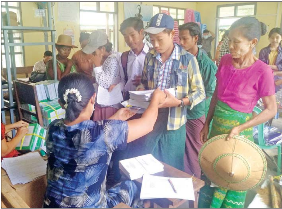
အင်္ဂပူမြို့နယ်၌ ကျောင်းသား ကျောင်းသူများ ကျောင်းအပ်နှံကြစဉ်။ မန်းကျော်(ပြန်/ဆက်)