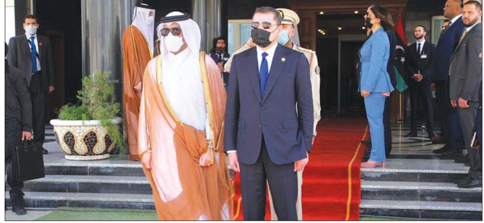
လစ်ဗျားဝန်ကြီးချုပ် အဗ္ဗူလာမန် ဒီဘီဘာနှင့် ကာတာနိုင်ငံခြားရေးဝန်ကြီး ရှိတ်မိဗိုလာမက်ဘင်အဗ္ဗူလာမန်အယ်သန်နီ ။

အစ္စရေးနိုင်ငံတွင် ကိုဗစ်-၁၉ ကာကွယ်ဆေးထိုးပြီးသူ ၅ ဒသမ ၄၄ သန်းရှိပြီး တိုင်းပြည်လူဦးရေ၏ ၅၈ ဒသမ ၃ ရာခိုင်နှုန်းကို ကာကွယ်ဆေးထိုးပေးပြီးဖြစ်သည်။ ဆင်ဟွာ