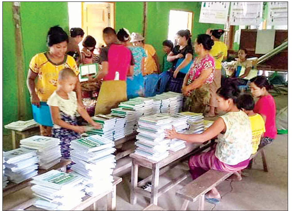
ပွင့်ဖြူမြို့နယ်၌ ကျောင်းသား ကျောင်းသူများ ကျောင်းအပ်နှံကြစဉ်။ နတ်မောက်သား