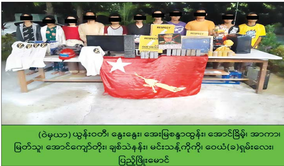
(ဝဲမှယာ) ယုန်းဝတီ၊ နွေးနွေး၊ အေးမြစန္ဒာထွန်း၊ အောင်ခြံမိုး၊ အာကာ၊ မြတ်သူ၊ အောင်ကျော်တိုး၊ ချစ်သဲနန်း၊ မင်းသန့်ကိုကို၊ ဝေယံ(ခ)ရှမ်းလေး၊ ပြည့်ဖြိုးမောင်

လုံခြုံရေးတပ်ဖွဲ့ဝင်များသည် လက်လုပ်ဗုံးဖြင့် ပစ်ခတ်ထွက်ပြေးသွားသူများကို ဖမ်းဆီးရမိနိုင်ရေးအတွက် လိုက်လံစုံစမ်းခဲ့ရာ အဆိုပါရပ်ကွက်အတွင်းရှိ (၅၉)လမ်းနှင့် (၁၀၈) လမ်းထောင့်အရောက်၌