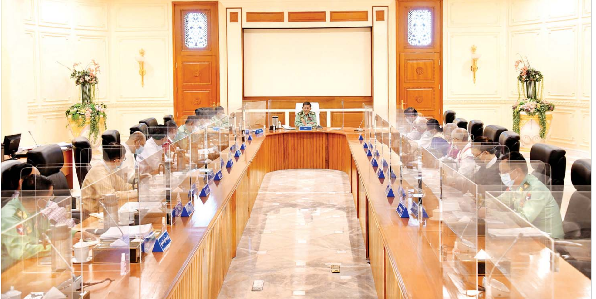
နိုင်ငံတော်စီမံအုပ်ချုပ်ရေးကောင်စီဥက္ကဋ္ဌ၊ တပ်မတော်ကာကွယ်ရေးဦးစီးချုပ် ဗိုလ်ချုပ်မှူးကြီး မင်းအောင်လှိုင် နိုင်ငံတော်စီမံအုပ်ချုပ်ရေးကောင်စီအစည်းအဝေး (၁၁/၂၀၂၁)တွင် အမှာစကား ပြောကြားစဉ်။ သတင်းစဉ်