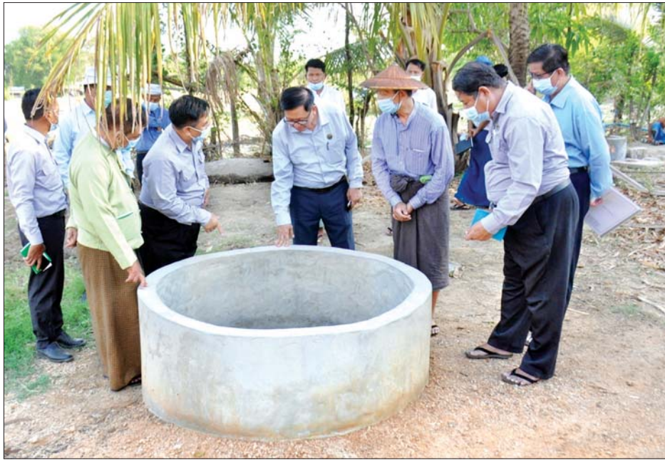
မြိုင်မြိုင်နယ် လယ်စုညောင်ပင်ကျေးရွာရှိ တူးဖော်ထားသော ရေတွင်းကို ကြည့်ရှုစစ်ဆေးစဉ်။

နံနက်ပိုင်းက ဧရာဝတီမြစ်ကမ်းနံဘေးရှိ ညောင်ဦးမြို့နယ် လက်ပံခြေပေါ် မြစ်ရေတင်လုပ်ငန်းကို ကြည့်ရှုခဲ့သည်။ ညောင်ဦးမြို့နယ်၌ လွန်ခဲ့သည့် ၁၀ နှစ်က ပျမ်းမျှရေချိန် ၂၆ လက်မ ရွာသွန်းခဲ့သည်။ ပြီးခဲ့သည့် နှစ်နှစ် သုံးနှစ်ခန့်ကစ၍