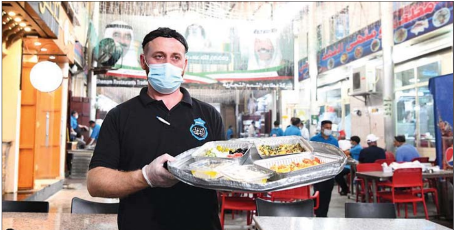
ကူဝိတ်စီးတီးရှိ စားသောက်ဆိုင်တစ်ဆိုင်မှ ဝန်ထမ်းတစ်ဦးကို တွေ့ရစဉ်။

ကို ပိတ်ပင်စဉ် ကာလက ဖောက်သည်များကို ၎င်းတို့၏ ကားများပေါ်သို့ အစားအသောက်များ ပို့ဆောင်သည့် စနစ်ကိုသာ လုပ်ဆောင်ခဲ့ရသည်။ ကူဝိတ်နိုင်ငံသားတစ်ဦး ဖြစ်သူ အိုစမာအယ်ဖက်လီက စားသောက်ဆိုင်များ ပြန်ဖွင့်ခွင့်ပေးခြင်းမှာ ပုံမှန်နေထိုင်မှုဘဝ ပြန်ရောက်ရန် အစပျိုးမှုတစ်ခုဖြစ်ကြောင်း၊ အစိုးရသည် ပြည်သူများ အားလုံးကို ကာကွယ်ဆေးထိုးပေးနိုင်ရေးကြိုးပမ်းလျက်ရှိသည်ဟု