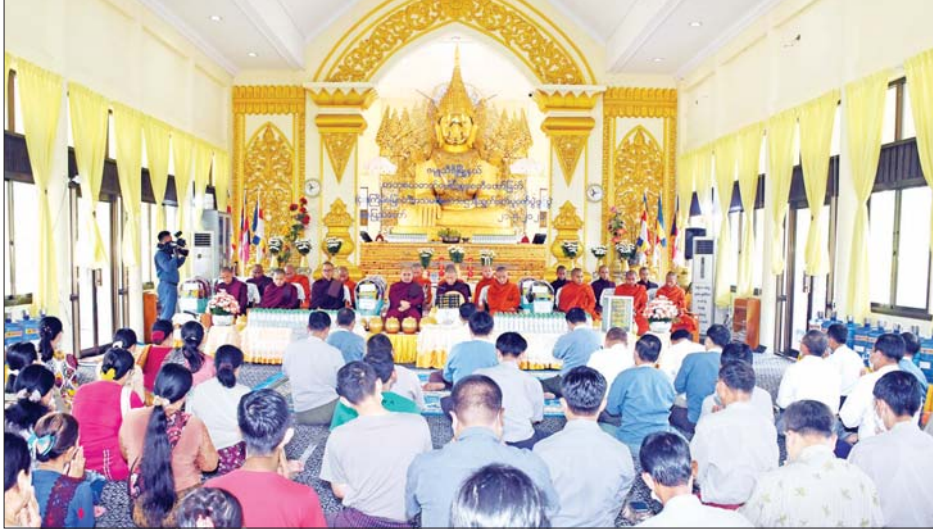
တက်ရောက်ကြည့်ကြည့်ကြသည်။ ပဓာနနာယကဆရာတော် ဘဒ္ဒန္တဉာဏိဿရ အရှင် ရှေးဦးစွာ မဟာဝိဇိတာရုံစာသင်တိုက်ကြီး၏ သူမြတ်ထံမှ ဧည့်ပရိသတ်များက ငါးပါးသီလခံယူ

နေပြည်တော်ကောင်စီနယ်မြေ ဇေယျာဓိရာဇ်မြို့နယ်ရှိ ဓာတုဓာတ်ပေါင်းစု စေတီမြတ်ကြီး၏ အကြိမ် (၄၀)မြောက် အသံမစဲမဟာပဋ္ဌာန်း ရွတ်ဖတ်ပူဇော်ပွဲ ဖွင့်ပွဲအခမ်းအနားကို ယနေ့နံနက်ပိုင်းက စေတီမြတ်ကြီး ပရိဝုဏ်အတွင်းရှိ မဟာမြတ်မုနိ ရုပ်ရှင်တော်မြတ် ဂန္ဓကုဋ်ကျောင်းဆောင်၊ အဘိသန္ဓ ဗိမာန်တော်၌ ကျင်းပသည်။ (ယာပုံ)