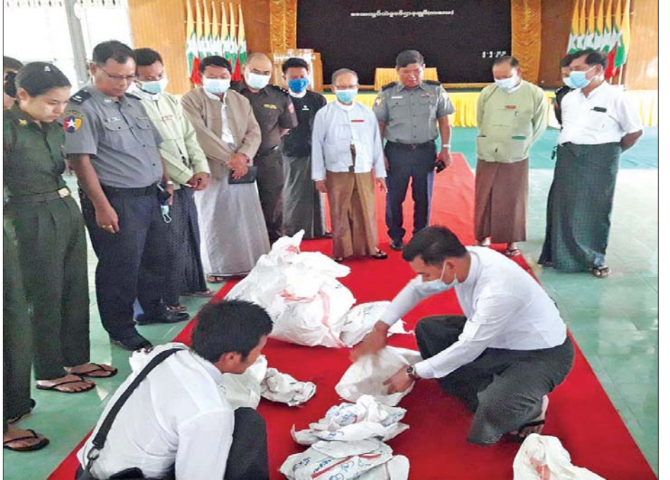
ကလေးဝမြို့နယ် ဆန္ဒမဲလက်မှတ် မြေပြင်စစ်ဆေးမှု မှတ်တမ်းဓာတ်ပုံ။