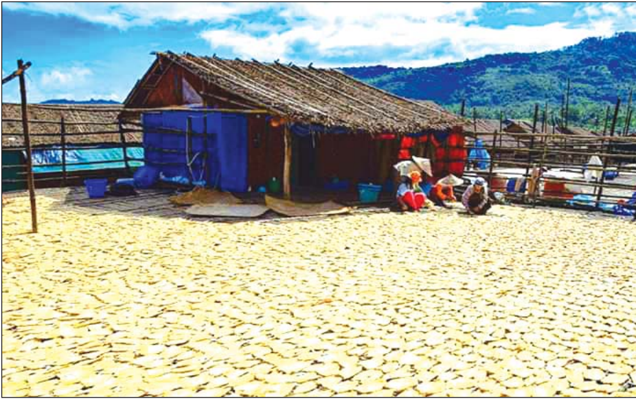
ကကူရံငါးများနှင့် ငါးပုပ်ခြောက်ငါးများအား နေလှန်းနေစဉ်။

ရန်ကုန် မေ ၂၁ ငါးပုပ်ခြောက်နှင့် ငါးစည်ဖောင်းကို အာရှနိုင်ငံများသို့ တင်ပို့ရောင်းချလျက်ရှိရာ ကုန်ကြမ်းရှားပါးလာချိန်တွင် ပြည်ပမှ ကုန်ကြမ်းတင်သွင်း၍ တန်ဖိုးမြင့်ကုန်ချောထုတ်လုပ်တင်ပို့ခြင်းဖြင့် နိုင်ငံအတွက် အခွန်ငွေပိုမိုရရှိစေမည်ဖြစ်ကြောင်း သိရသည်။ သဘာဝပြောင်းလဲမှုကြောင့် ငါးရှားပါးလာချိန်၌ ပင်လယ်ချင်းထိစပ်နေသည့် အိမ်နီးချင်းနိုင်ငံမှ ကကူရံငါးကိုတင်သွင်းပြီး အခြောက်ပြုလုပ်သည့်နည်းတူ ငါးစည်ဖောင်းထုတ်လုပ်၍ တန်ဖိုးမြင့်ထုတ်ကုန်အဖြစ် ထုတ်လုပ်ကာ အပြိုင်အဆိုင် ဝယ်ယူနေသော ပြည်ပ ဈေးကွက်သို့ မြန်မာနိုင်ငံမှတင်ပို့လျက်ရှိရာ ထိုငါးကို တရားဝင်တင်သွင်းခြင်းဖြင့်ပို့ကုန်မှ နိုင်ငံအတွက် အခွန်ငွေနှစ်မျိုးရရှိနိုင်ကြောင်း သိရသည်။ “သဘာဝ ငါးရှားပါးလာတဲ့အတွက် ကကူရံငါးနဲ့ ငါးပုပ်ခြောက် ငါးကို ပြည်ပကတင်သွင်းနိုင်ရင် အဆင်ပြေမယ်။ ကကူရံငါးက ငါးစည်ဖောင်းလည်း ရတယ်။ လုပ်ငန်းရှင်တွေလည်း ရေရှည်ရပ်တည်နိုင်မယ်။ ထိုင်းနိုင်ငံက တစ်ဆင့်ခံပြီး တင်သွင်းနေပေမယ့်နိုင်ငံတော်က အခွန်မရဘူး။ တရားဝင်ပြည်ပကတင်သွင်းဖို့လိုမယ်။ ငါးပုပ်ခြောက်နဲ့ ငါးစည်ဖောင်းကို ပြည်ပတင်ပို့နေတာ ကြာပြီ။ ဈေးကွက်မှာ အပြိုင်အဆိုင် ဝယ်နေကြတာ။ အဲဒီအတွက် ကုန်ကြမ်းအဝင်အခွန်ရသလို ကုန်ချောတင်ပို့ရင်လည်း