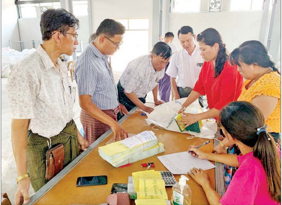
ဒီပဲယင်းမြို့နယ် ဆန္ဒမဲလက်မှတ် မြေပြင်စစ်ဆေးမှု မှတ်တမ်းဓာတ်ပုံ။