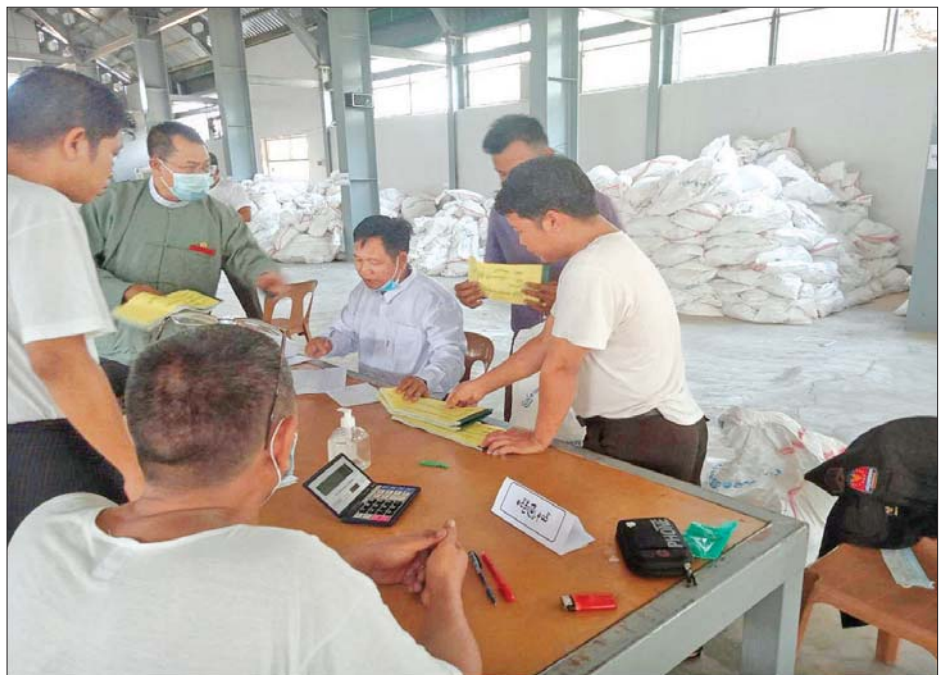
ခင်ဦးမြို့နယ် ဆန္ဒမဲလက်မှတ် မြေပြင်စစ်ဆေးမှု မှတ်တမ်းဓာတ်ပုံ။

၉။ ဒီပဲယင်းမြို့နယ် ညောင်လှကျေးရွာအုပ်စု မဲရုံအမှတ်(၁)တွင် ကြိုတင်မဲအတွက် ဆန္ဒမဲလက်မှတ်များ အား သီးသန့် အသုံးပြုထားခြင်းမရှိဘဲ ကျန်သည့်မဲရုံများအတွက်ပါ ရောနှောအသုံးပြုထားသည့် မဲလက်မှတ် စာအုပ် ၁၈ အုပ် (စောင်ရေ ၉၀၀)အား စိစစ်တွေ့ရှိရပါသည်။ မဲရုံမှူးများ လိုက်နာရမည့် သက်ဆိုင်ရာ လွှတ်တော်ရွေးကောက်ပွဲနည်းဥပဒေ ၆၆(ခ)ကို လိုက်နာခြင်းမရှိဘဲ အေးသာယာ၊ ဆယ်တော၊ မင်းဆွေနှစ်နှင့် သပိတ်လဲကျေးရွာအုပ်စုတို့မှ ရွေးကောက်ပွဲကျင်းပပြီး နောက်ပိုင်း ပြန်လည်အပ်နှံထားသော မဲလက်မှတ် စာအုပ် ၉ အုပ်(စောင်ရေ ၄၅၀) အား စိစစ်တွေ့ရှိရပါသည်။