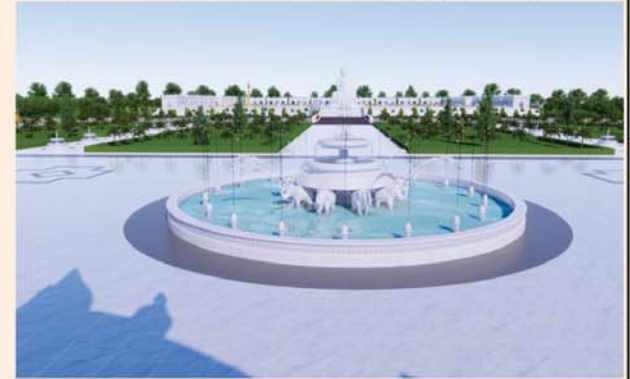
ရေပန်းအကြီး