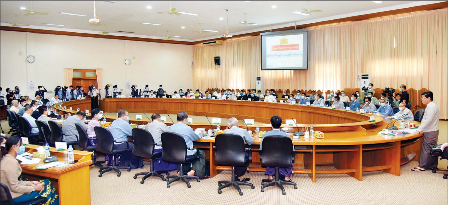
ပြည်ထောင်စုရွေးကောက်ပွဲကော်မရှင်နှင့် နိုင်ငံရေးပါတီများ တွေ့ဆုံညှိနှိုင်းအစည်းအဝေးကျင်းပစဉ်။ သတင်းစဉ်

နေပြည်တော် မေ ၂၁ ပြည်ထောင်စုရွေးကောက်ပွဲကော်မရှင်နှင့် နိုင်ငံရေးပါတီများ တွေ့ဆုံညှိနှိုင်းအစည်းအဝေးကို ယနေ့ နံနက် ၉ နာရီတွင် နေပြည်တော်ရှိ ပြည်ထောင်စုရွေးကောက်ပွဲကော်မရှင်ရုံး အစည်းအဝေးခန်းမ၌ ကျင်းပပြုလုပ်ရာ ပြည်ထောင်စုရွေးကောက်ပွဲကော်မရှင်ဥက္ကဋ္ဌ ဦးသိန်းစိုးနှင့် ကော်မရှင်အဖွဲ့ဝင်များ၊ ကော်မရှင်ရုံးမှ တာဝန်ရှိသူများနှင့် နိုင်ငံရေးပါတီ ၅၉ ပါတီမှ တာဝန်ရှိသူများ တက်ရောက်ကြသည်။ အစည်းအဝေးတွင် ပြည်ထောင်စုရွေးကောက်ပွဲကော်မရှင်ဥက္ကဋ္ဌက အမှာစကားပြောကြားရာ၌ ပထမအကြိမ်တွေ့ဆုံစဉ်က ဆွေးနွေးခဲ့ကြသည့် ဥပဒေပြင်ဆင်ခြင်းလုပ်ငန်းများ ဆောင်ရွက်နိုင်ရေးနှင့် စပ်လျဉ်း၍ အနည်းဆုံး ရက်ပေါင်း ၉၀ ထက် မနည်း မဆန္ဒနယ်ပြင်ပရောက် မဲဆန္ဒရှင်များ မဲပေးခြင်းဥပဒေ၊ နည်းဥပဒေများကို ပြင်ဆင်ရန်ဆောင်ရွက်လျက်ရှိပြီး မဲစာရင်းကောက်ယူရာတွင် လဝက၏ ဆွေးနွေးခဲ့ကြသည့် အသက် (၁၈) နှစ်ပြည့်ပြီး မဲပေးခွင့်ရှိသူ မှတ်ပုံတင်ကိုင်ဆောင်ထားသူများကို ပုံစံ ၆၆ လူဦးရေစာရင်းမှ ရယူပြီး အထွေထွေအုပ်ချုပ်ရေးဦးစီးဌာနနှင့် တိုက်ဆိုင်စစ်ဆေးကာ မြို့နယ်ကော်မရှင်အဖွဲ့ခွဲမှ တာဝန်ယူစာရင်းထည့်သွင်းကောက်ယူသွားရန် စီစဉ်ထားပါကြောင်း၊ စာမျက်နှာ ၄ ကော်လံ ၁ ❖