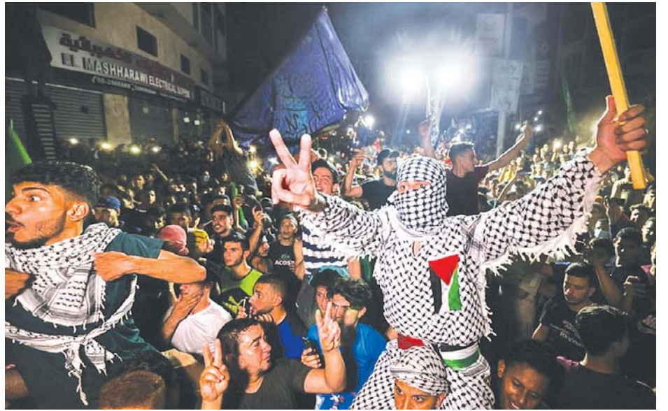
အပစ်အခတ်ရပ်စဲလိုက်သည့်အတွက် လမ်းပေါ်ထွက်ကာပျော်ရွှင်နေကြသည့် ပါလက်စတိုင်းပြည်သူများကို တွေ့ရစဉ်။