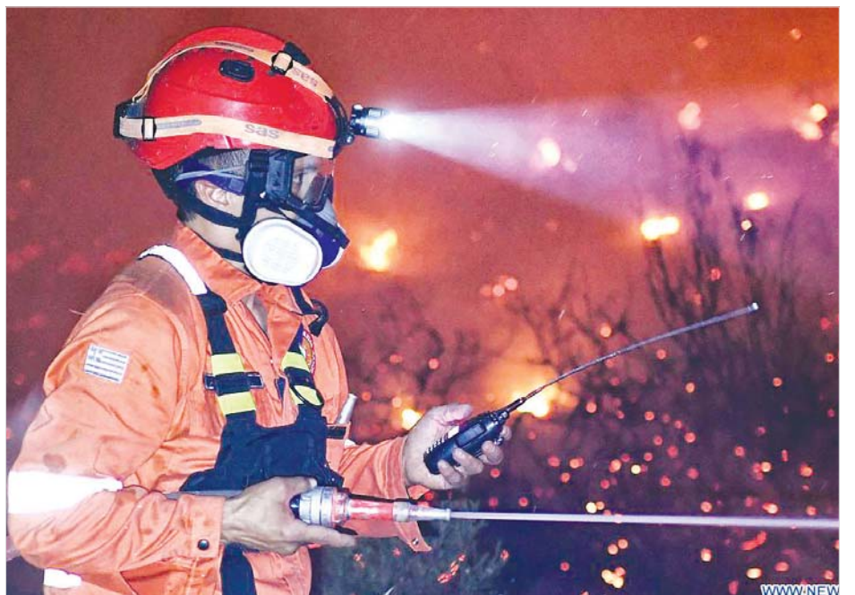
တောမီးလောင်မှုကိုငြိမ်းသတ်နေသည့် မီးသတ်သမားတစ်ဦးကို တွေ့ရစဉ်။