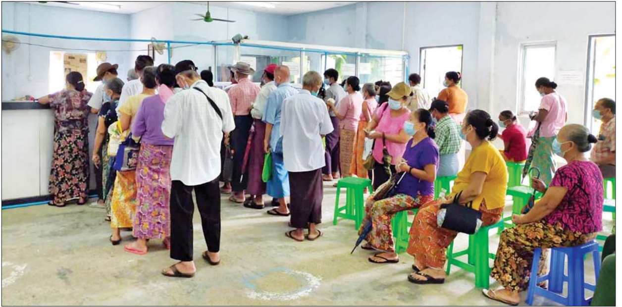
မြန်မာ့စီးပွားရေးဘဏ်တွင် အငြိမ်းစားနိုင်ငံ့ဝန်ထမ်းများ၏ ပင်စင်လစာငွေများ ထုတ်ပေးနေမှုကို တွေ့ရစဉ်။

အငြိမ်းစားလစာငွေများကို E-Pension ကတ်အသုံးပြု၍ သက်ဆိုင်ရာ မြန်မာ့စီးပွားရေးဘဏ်ခွဲများတွင်လည်းကောင်း၊ မြန်မာ့စီးပွားရေးဘဏ် ATM ကတ်အသုံးပြု၍လည်းကောင်း၊ Mobile Internet အသုံးပြုဆောင်ရွက်သည့် Myanmar Mobile Money (MMM), MPT Pay, Mytel Pay များ အသုံးပြု၍ မိမိတို့နှင့်နီးစပ်ရာ Mobile Agents များထံတွင် လည်းကောင်း၊ အငြိမ်းစားလစာများ လစဉ်ထုတ်ယူရန် သတ်မှတ်ထားသည့် ၂၁ ရက်နေ့မှစ၍ ဘဏ်ဖွင့်ရက်များတွင် ဘဏ်လုပ်ငန်းချိန်အတွင်း အငြိမ်းစားလစာငွေများကို အဆင်ပြေချောမွေ့စွာ