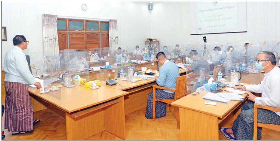
ပိုးသတ်ဆေးမှတ်ပုံတင်အဖွဲ့၏ (၃၃) ကြိမ်မြောက် အစည်းအဝေးတွင် ပိုးသတ်ဆေး မြန်မာနိုင်ငံတွင် ပိုးသတ်ဆေး ကျင်းပသည့် ပိုးသတ်ဆေး မှတ်ပုံ တင်ခွင့်ပြုပေးထားပြီး ယနေ့ အစည်းအဝေးတွင် ပိုးသတ်ဆေး အမျိုးပေါင်း ၁၅၂ မျိုး၏ နည်း

အစည်းအဝေးတွင် ဒုတိယ သီးနှံများနှင့် ပိုးမွှားရောဂါများ ဝန်ကြီး ဒေါက်တာအောင်ကြီးက အပေါ် ထိရောက်မှု၊ ဓာတ်ကြွင်း ပိုးသတ်ဆေး သုံးစွဲသူများ အာနိသင်နှင့် ပတ်ဝန်းကျင်အပေါ် ဘေးအန္တရာယ် ကင်းရှင်းရန်၊ ထိခိုက်မှုအနည်းဆုံးဖြစ်စေရေး စားသုံးသူများနှင့် သဘာဝ ပတ်ဝန်းကျင် ဘေးအန္တရာယ် ကင်းရှင်းရန်တို့ကို ရည်ရွယ် ကြောင်း၊ သီးနှံအထွက်နှုန်းတိုး ရေးသာမက စားသုံးသူဘေးကင်း လုံခြုံရေးနှင့် ပြည်ပဈေးကွက်၏ သတ်မှတ်စံနှုန်းများနှင့် ညီညွတ် သည့် စိုက်ပျိုးရေးထွက်ကုန်များ ထုတ်လုပ်နိုင်ရေးသည် ပိုးသတ် ဆေးများအပေါ် များစွာတည်မှီနေ စေရမည် ဟု ပြောကြားသည်။