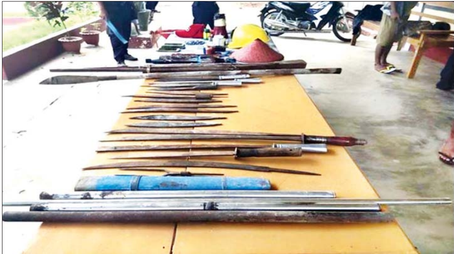
တန့်ဆည်မြို့နယ်၌ ဆူပူအကြမ်းဖက်ရာတွင် အသုံးပြုသည့် တူမီးသေနတ်နှင့် အခြားဆက်စပ်ပစ္စည်းများ ကို သိမ်းဆည်းရမိစဉ်။