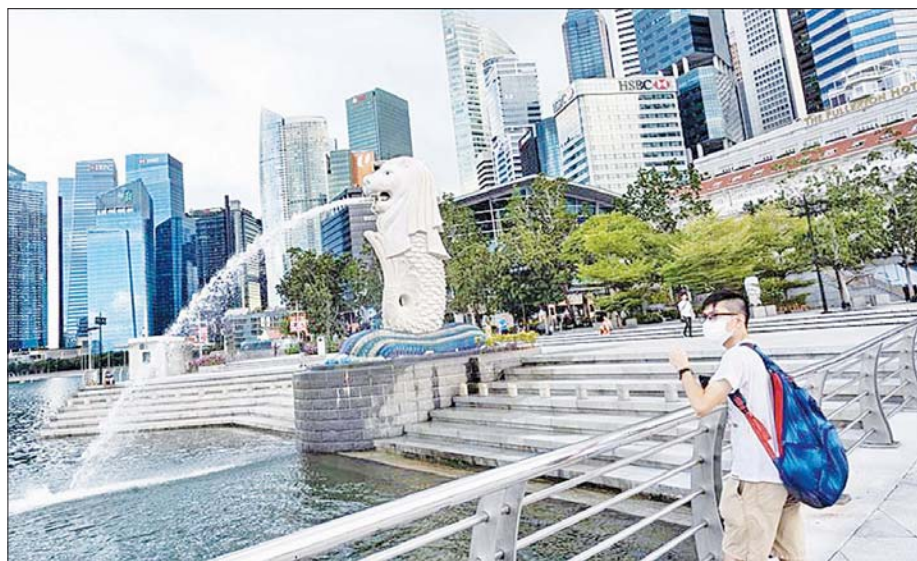
စင်ကာပူနိုင်ငံ၏ အထိမ်းအမှတ်နေရာတစ်ခုဖြစ်သည့် မာလိုင်ယွန်းအနီး နှာခေါင်းစည်းတပ်ဆင် ထားသည့် ပြည်သူတစ်ဦး လာရောက်အပန်းဖြေနေသည်ကို တွေ့ရစဉ်။

နောက်ထပ် ကိုဗစ်-၁၉ ကပ်ရောဂါဖြင့်သေဆုံး သူ ၅၀ တိုးလာမှုနှင့်အတူ စုစုပေါင်း ကိုဗစ်-၁၉ ကပ်ရောဂါဖြင့်သေဆုံးသူ ၂၁၄၉ ဦးရှိလာခဲ့သည်။ ကိုဗစ်-၁၉ ကူးစက်ဖြစ်ပွားမှုမှ ပြန်လည်ကောင်းမွန် လာပြီး ဆေးရုံမှ ဆင်းလာသူ ၄၄၄၅၄၀ သို့မဟုတ် ၈၉ ဒသမ ၁ ရာခိုင်နှုန်းရှိသည်။