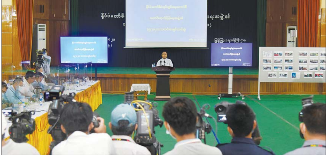
နိုင်ငံတော်စီမံအုပ်ချုပ်ရေးကောင်စီ၊ သတင်းထုတ်ပြန်ရေးအဖွဲ့က သတင်းမီဒီယာများနှင့်တွေ့ဆုံ၍ ၅/၂၀၂၁ ကြိမ်မြောက် သတင်းစာရှင်းလင်းပွဲကျင်းပစဉ်။

ဗိုလ်ချုပ် ဇော်မင်းထွန်းက အကြမ်း ဖက် အဖွဲ့အစည်းအဖြစ် ကြေညာထား သည့်များလည်း ပြောပြီးဖြစ်ပါကြောင်း၊ အကြမ်းဖက် အဖွဲ့အစည်းများကို အားပေးကူညီလျှင်၊ ပါဝင်လျှင် ဥပဒေ နှင့်ပြည့်မီအဖြစ်ဖက်ဖက်တိုက်ဖျက်ရေး ဥပဒေများကိုလည်း ပြောပြီးဖြစ်ပါ ကြောင်း၊ ထည့်သွင်းဖွဲ့စည်းထားခြင်းကို မိမိတို့တွေ့ရပါကြောင်း၊ ထည့်သွင်းထား ခြင်းနှင့်ပတ်သက်ပြီး ကာယကံရှင်များ ကိုယ်တိုင် သဘောတူညီမှုမရှိ/မရှိ မသိရ ပါကြောင်း၊ သဘောတူညီချက်ရှိသည် ဟုလည်း ယူဆ၍မရပါကြောင်း၊ နိုင်ငံရေးပါတီများနှင့် ပတ်သက်ပြီး ဖွဲ့စည်းပုံအခြေခံဥပဒေတွင် ပြဋ္ဌာန်းထား ပြီးဖြစ်ပါကြောင်း၊ နိုင်ငံရေးပါတီများ အနေဖြင့် ပုဒ်မ ၄၁၇ (ခ) အရ နိုင်ငံတော် ကို လက်နက်ကိုင်တော်လှန်နေသည့် သောင်းကျန်းသူအဖွဲ့အစည်း သို့မဟုတ် အကြမ်းဖက်လုပ်ရပ်များကို ကျူးလွန် သည့်ဟု နိုင်ငံတော်က သတ်မှတ်ထား သည့် အဖွဲ့အစည်းနှင့် ပုဂ္ဂိုလ်များ သို့မဟုတ် မတရားအသင်းအဖြစ် ကြေညာခံထားရသည့် အဖွဲ့များနှင့် တိုက်ရိုက်ဖြစ်စေ၊ သွယ်ဝိုက်၍ဖြစ်စေ ဆက်သွယ်ခြင်း၊ အားပေးကူညီခြင်း ရှိလျှင် ဆက်လက်ရပ်တည်ပိုင်ခွင့် မရှိ စေရဟု ပြဋ္ဌာန်းထားပြီးဖြစ်ပါကြောင်း၊ နိုင်ငံရေးပါတီများ မှတ်ပုံတင်ခြင်း ဥပဒေ တွင်လည်း အသေးစိတ် ပြဋ္ဌာန်းထားပြီး ဖြစ်ပါကြောင်း၊ ထို့ကြောင့် ဥပဒေအရ ငြိစွန်းမှုရှိလာလျှင် ဥပဒေအတိုင်း ဆောင် ရွက်ရမည်ဖြစ်သည်ဟု ပြန်လည်ဖြေ ကြားသည်။