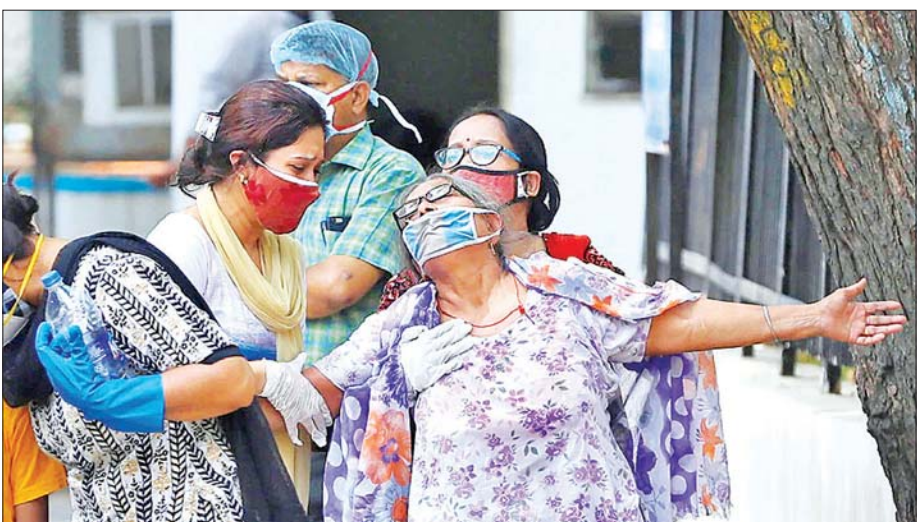
အိန္ဒိယနိုင်ငံ၌ ကိုဗစ်-၁၉ ကပ်ရောဂါဖြင့် သားသေဆုံးခဲ့သည့်အတွက် ဝမ်းနည်းပူဆွေးနေသော မိခင်တစ်ဦးကို တွေ့ရစဉ်။

ကိုဗစ်-၁၉ ထပ်မံကူးစက်ဖြစ်ပွားမှုကို တားဆီး ထိန်းချုပ်ရန် နိုင်ငံတစ်ဝန်း ကိုဗစ်-၁၉ အရေးပေါ် အခြေအနေပြဌာန်းချက်ကို ဇူလိုင် ၃၁ ရက်အထိ