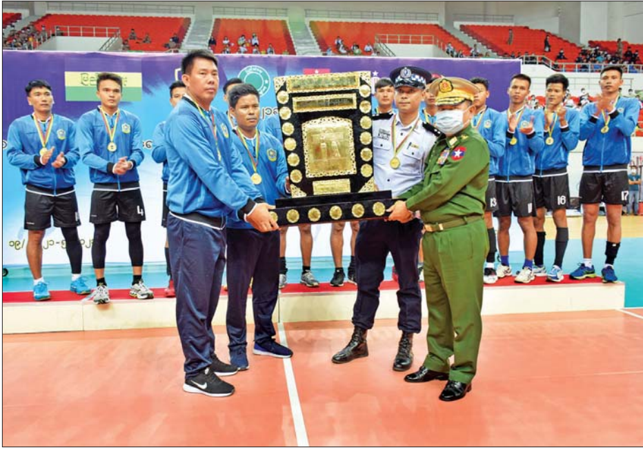
ရှေးဦးစွာ အမျိုးသား၊ အမျိုး သမီး ဗိုလ်လုပွဲစဉ်များ ယှဉ်ပြိုင် ဖြင့် လည်းကောင်း၊ အမျိုးသား ကစားကြရာ အမျိုးသမီးဘော်လီ ဘော ဗိုလ်လုပွဲစဉ်တွင် မြန်မာ နိုင်ငံ ရဲတပ်ဖွဲ့အသင်းက အကျဉ်း ပေးအပ်ချီးမြှင့် ဆက်လက်၍ ဆုချီးမြှင့်ခြင်း အခမ်းအနားကိုကျင်းပရာ ပွဲစဉ်

နေပြည်တော် မေ ၂၁ (၁၈)ကြိမ်မြောက် ပြည်ထဲရေး ဝန်ကြီးဌာန ပြည်ထောင်စုဝန်ကြီး တံခွန်စိုက်ခိုင်း (အမျိုးသား၊ အမျိုး သမီး) ဘော်လီဘောပြိုင်ပွဲ ဗိုလ်လု ပွဲနှင့် ဆုချီးမြှင့်ပွဲအခမ်းအနားကို ယနေ့ မွန်းလွဲ ၃ နာရီတွင် နေပြည်တော်ဝဏ္ဏသိဒ္ဓိအားကစား ကွင်း (B) ရုံတွင် ကျင်းပရာ နိုင်ငံတော် စီမံအုပ်ချုပ်ရေး ကောင်စီအဖွဲ့ဝင်၊ ပြည်ထဲရေး ဝန်ကြီးဌာန ပြည်ထောင်စုဝန်ကြီး ဒုတိယဗိုလ်ချုပ်ကြီး စိုးထွဋ်နှင့် ဇနီး၊ ဒုတိယဝန်ကြီးများနှင့် ဇနီး များ၊ ပြည်ထဲရေးဝန်ကြီးဌာနမှ အရာရှိကြီးများနှင့် ဇနီးများ၊ တပ်ဖွဲ့/ဦးစီးဌာနများမှ တပ်ဖွဲ့ဝင် များနှင့် ဝန်ထမ်းမိသားစုဝင်များ တက်ရောက် ကြည့်ရှုအားပေး ခဲ့ကြသည်။