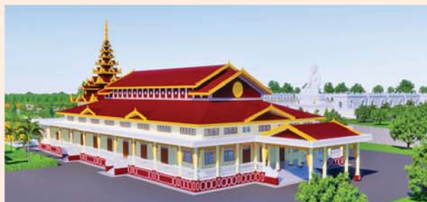
ဓမ္မာရုံ(၂၀၃x၉၀)ပေ ၁ လုံး-၈၇၀၀ သိန်း