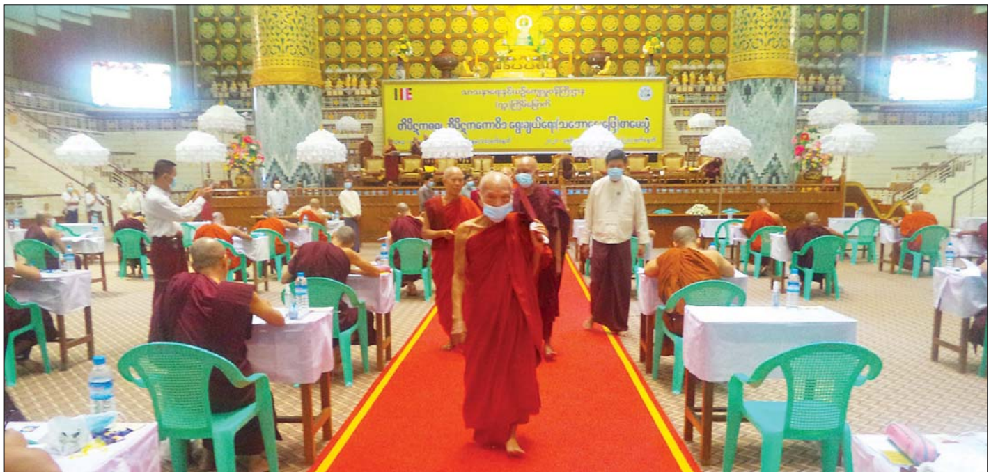
နိုင်ငံတော်သံဃမဟာနာယကအဖွဲ့ ဥက္ကဋ္ဌဆရာတော်ကြီး၊ အကျိုးတော်ဆောင်ဆရာတော်ကြီးနှင့် နိုင်ငံတော်သံဃမဟာနာယကအဖွဲ့၊ တာဝန်ကျ (ပထမအဖွဲ့ခွဲ) မှ ဆရာတော်ကြီးများက (၇၃) ကြိမ်မြောက် တိပိဋကဓရ တိပိဋကကောဝိဒ ရွေးချယ်ရေး (သဘောရေးဖြေ) စာမေးပွဲ ဖြေဆိုလျက်ရှိကြသော စာဖြေသံဃာများအား လိုက်လံကြည့်ရှုအားပေးချီးမြှောက်စဉ်။ သတင်းစဉ်