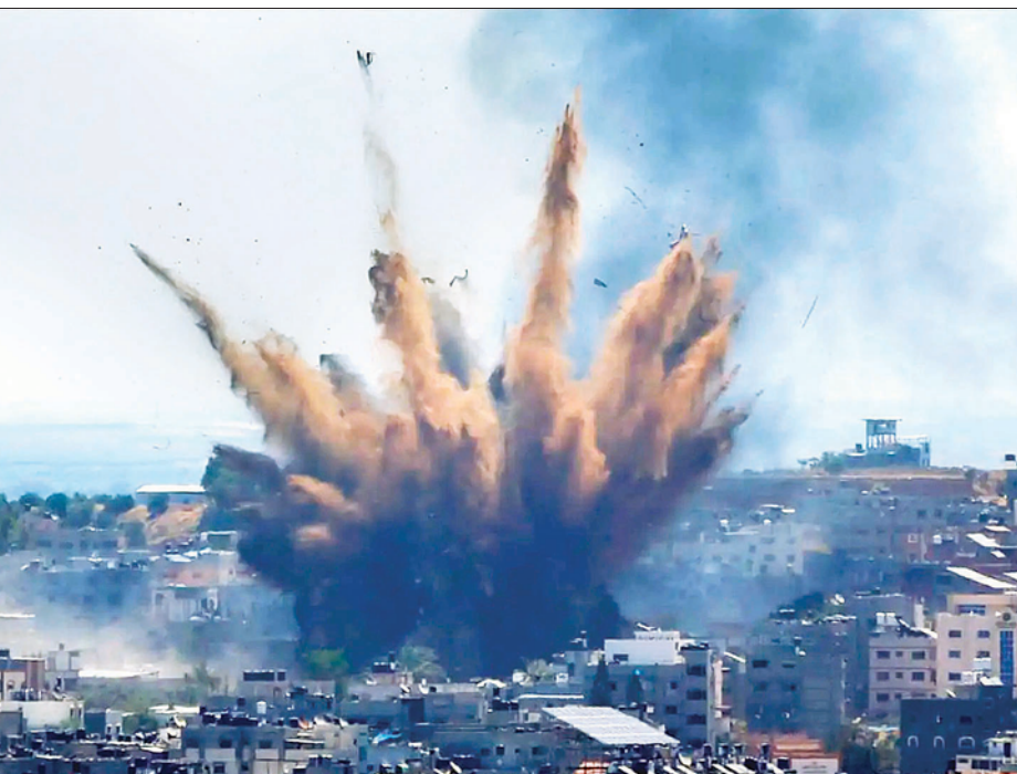
အစ္စရေးတို့က ဂါဇာမြို့ရှိ အဆောက်အအုံများကို လေကြောင်းတိုက်ခိုက်မှုပြုလုပ်သည့်အတွက် ပေါက်ကွဲမှုကို တွေ့ရစဉ်။

မကြာသေးမီက အစ္စရေးတို့၏ ဗုံးကြဲ တိုက်ခိုက်မှုများကြောင့် ပါလက်စတိုင်း ၂၁၉ ဦးသေဆုံးခဲ့ပြီး ၁၅၃၀ ဒဏ်ရာရရှိခဲ့ကြောင်း မေ ၁၉ ရက်က ဂါဇာကျန်းမာရေး ဝန်ကြီးဌာနက ထုတ်ပြန်ကြေညာလိုက်သည်။ ဆင်ဟွာ