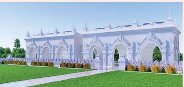
မြန်မာမှုတော်ကျောက်မြင့် တည်ဆောက်ပူဇော်ထားသော ဂန္ဓကုဋီတိုက် (၅၄x၂၇)ပေ ၂၄ လုံး ၁ လုံးလျှင်- ၁၂၅၀ သိန်း