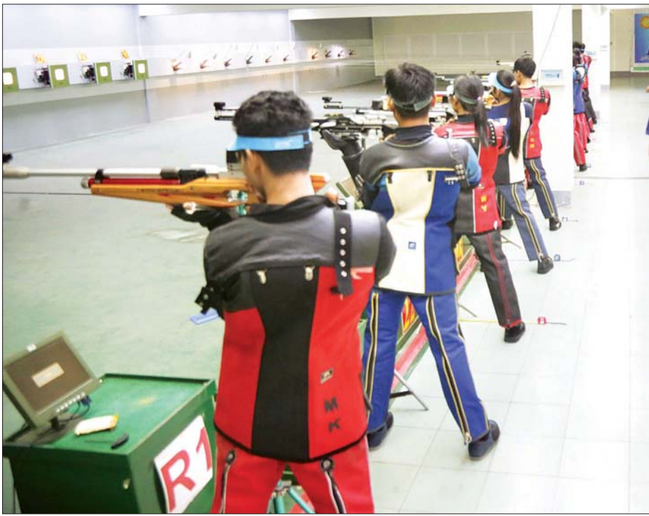
ဒဂုံမြို့သစ် မြောက်ပိုင်းမြို့နယ်ရှိ သေနတ်ပစ်အားကစားလေ့ကျင့်ရေးကွင်း၌ မြန်မာ့လက်ရွေးစင် သေနတ်ပစ် အားကစားသမားများ လေ့ကျင့်နေမှုကို တွေ့ရစဉ်။

* ကျော့ဖုံးမှ မြန်မာအားကစား အဖွဲ့များ လေ့ကျင့်နေမှုကို အားကစားနှင့် ကာယပညာဦးစီးဌာန ဒုတိယ ညွှန်ကြားရေးမှူးချုပ် ဦးကျော်ဦး၊ အားကစားနှင့် ကာယပညာ သိပ္ပံ (ရန်ကုန်) ကျောင်းအုပ်ကြီး ညွှန်ကြားရေးမှူး ဦးကျော်စိုးမိုး၊ ရန်ကုန်တိုင်းဒေသကြီး အားကစား နှင့် ကာယပညာဦးစီးဌာန ညွှန်ကြားရေးမှူး ဦးအောင်မိုး တို့နှင့်အတူ တာဝန်ရှိသူများ လိုက်ပါလျက် မေ ၁၇ ရက် က ရန်ကုန်မြို့ရှိ အားကစားစခန်းများ သို့လိုက်လံကြည့်ရှုအားပေးစကား ပြောကြားသည်။ ရှေးဦးစွာ ဒုတိယ ညွှန်ကြားရေးမှူးချုပ်နှင့် အဖွဲ့ သည် အင်းလျားလမ်းရှိ လေ့ကျင့် အားကစားလေ့ကျင့်ရေး စခန်း သို့ လည်းကောင်း၊ ဒဂုံမြို့သစ် မြောက်ပိုင်းမြို့နယ်ရှိ သေနတ်ပစ် အားကစားလေ့ကျင့်ရေးကွင်း၌ လေ့ကျင့်လျက်ရှိသော မြန်မာ့ လက်ရွေးစင် သေနတ်ပစ် အားကစားသမားများအား သွား ရောက်တွေ့ဆုံ အားပေးစကား ပြောကြားပြီး မြန်မာနိုင်ငံ သေနတ်ပစ်အဖွဲ့ချုပ်ဥက္ကဋ္ဌဦးကျော် မိုးဝင်းက လေ့ကျင့်မှုအစီအစဉ်