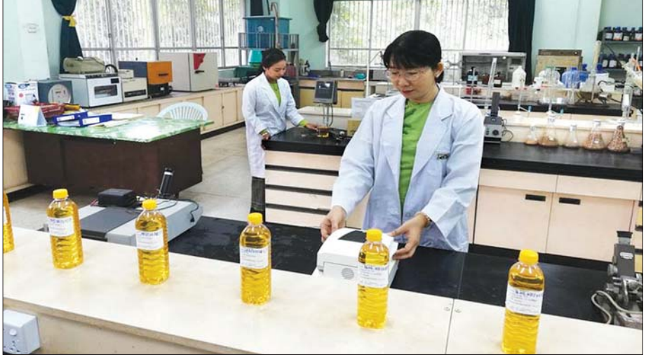
စားသုံးဆီများ အရည်အသွေးစစ်ဆေးရန် ဓာတ်ခွဲခန်း၌ ဆောင်ရွက်နေမှုကို တွေ့ရစဉ်။

“မာယာ” ဟူသည် ပရိယာယ်ကြွယ်ဝစွာဖြင့် ဟန်ဆောင်တတ်ခြင်းဖြစ်ပါသည်။ တစ်နည်းအားဖြင့် တစ်ပါးသူမရိပ်စားမိလောက်အောင် ပိရီသေသပ်စွာဖြင့် လှည့်စားတတ်သော အတတ်ပညာကို “မာယာ” ဟုခေါ်ဆိုနိုင်ပါသည်။ ဤလောကတွင် သက်ရှိလူသားများသည်သာ မာယာများတတ်ကြသည်မဟုတ်ဘဲ စားသုံးဆီများကလည်း မာယာများတတ်သည်ဟုဆိုလျှင် အံ့ဩကြပေလိမ့်မည်။ စားသုံးဆီအရည်အသွေး စစ်ဆေးရသော ဓာတ်ခွဲခန်းမှူးတစ်ဦးအနေဖြင့် စားသုံးဆီတို့၏ အခြေခံသဘာဝများကို စာအုပ်စာတမ်းများ ဖတ်ရှုလေ့လာခဲ့ရာမှ အတော်အတန် သိရှိခဲ့ရပါသည်။ ထို့အပြင် ဓာတ်ခွဲခန်းအတွင်း စားသုံးဆီမျိုးစုံကို စစ်ဆေးပေးခဲ့ရသည့် အတွေ့အကြုံများအရ စားသုံးဆီတို့၏ မာယာမျိုးစုံအဖုံဖုံကို သိမြင်ခဲ့ရခြင်းဖြစ်ပါသည်။