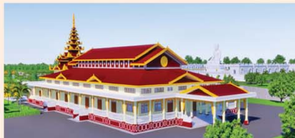
ဓမ္မာရုံ(၂၃x၉၀)ပေ ၁ လုံး-၈၇၀ သိန်း