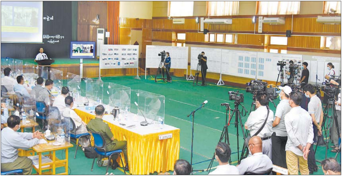
နိုင်ငံတော်စီမံအုပ်ချုပ်ရေးကောင်စီ၊ သတင်းထုတ်ပြန်ရေးအဖွဲ့က သတင်းမီဒီယာများနှင့်တွေ့ဆုံ၍ ၅/၂၀၂၁ ကြိမ်မြောက် သတင်းစာရှင်းလင်းပွဲကျင်းပစဉ်။

ပြည်ထောင်စု ရွေးကောက်ပွဲ ကော်မရှင်အဖွဲ့ဝင် ဦးခင်မောင်ဦးက ထိုကိစ္စနှင့်ပတ်သက်ပြီး ဆောင်ရွက်ဆဲ ကိစ္စဖြစ်ပါကြောင်း၊ PR စနစ်နှင့် ပတ်သက်ပြီး PR စနစ်ကလည်း မျိုးကွဲ များစွာရှိသည့်အတွက် မည်သည့် PR စနစ်ကို ကျင့်သုံးမည်၊ မည်သည့် ပုံစံမျိုး ကျင့်သုံးမည်ဆိုသည်ကို တိတိ ကျကျ အဖြေထွက်သေးပါကြောင်း၊ ထို့ကြောင့် အချိန်အတိအကျမပြောနိုင် သေးပါကြောင်း၊ သင့်တော်သည့်ကာလ တစ်ခုယူရမည်ဖြစ်ကြောင်း၊ နောက်ပိုင်း မှာ ထိုကိစ္စနှင့်ပတ်သက်ပြီး အသေးစိတ် သိမှသာ ဖြေကြားနိုင်မည်ဖြစ်ပါကြောင်း ဖြေကြားသည်။