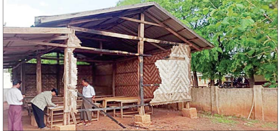
ရမည်းသင်းမြို့နယ် ကျောက်ဖူးကျေးရွာရှိ အခြေခံပညာအထက်တန်းကျောင်း မီးရှို့ခံရမှုကို တွေ့ရစဉ်။