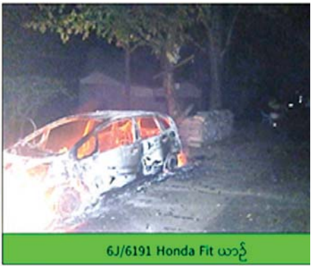
6J/6191 Honda Fit ယာဉ်