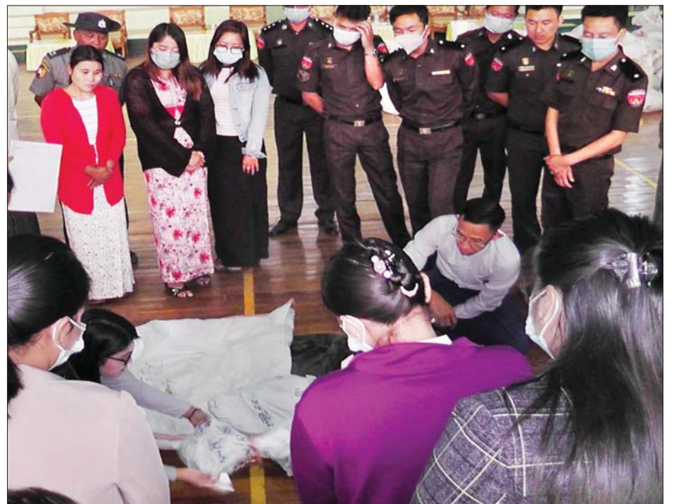
တောင်ကြီးမြို့နယ် ဆန္ဒမဲလက်မှတ် မြေပြင်စစ်ဆေးမှု မှတ်တမ်းဓာတ်ပုံများ။