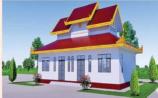
ဂေါဟကနံ (၄၈x၂၄)ပေ ၁ လုံး-၄၂၃ သိန်း