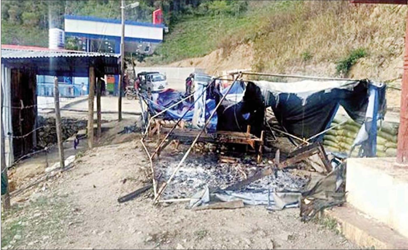
တီးတိန်မြို့ လေးလမ်းရပ်ကွက်ရှိ မြို့ဝင်ထွက် စစ်ဆေးရေးဂိတ်ရှိ ယာယီရွက်ဖျင်တံ နှစ်လုံး မီးရှို့ဖျက်ဆီးခံရမှုကို တွေ့ရစဉ်။