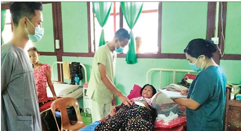
ဆက်လက်၍လည်း တပ်မတော်အနေဖြင့် ပြည်သူ့ အရှိန်အဟုန်ဖြင့် ပူးပေါင်းဆောင်ရွက်သွားမည်ဖြစ် ကြောင်း သတင်းရရှိသည်။ သတင်းစဉ်

များနှင့် ယာယီကုသရေးဆေးရုံများတွင် ကျန်းမာရေး စောင့်ရှောက်မှုများကို နေ့ညမပြတ် ဆောင်ရွက်ပေး လျက်ရှိရာ ဖေဖော်ဝါရီ ၅ ရက်မှ ယနေ့အထိ ပြင်ပ လူနာပေါင်း ၂၁၁၁၈၆ ဦးနှင့် အတွင်းလူနာပေါင်း ၆၄၄၄၉ ဦးတို့ကို ကုသပေးနိုင်ခဲ့သည်။ ၎င်းလူနာများအနက် အကြီးစားခွဲစိတ်ကုသရန် လိုအပ်သူ ၉၈၆၇ ဦး၊ အသေးစားခွဲစိတ်ကုသရန် လိုအပ်သူ ၅၀၀၉ ဦး၊ စုစုပေါင်း ၁၄၈၇၆ ဦးတို့ကို ခွဲစိတ်ကုသပေးနိုင်ခဲ့သည့်အပြင် စိုးရိမ်ဖွယ်ရာရှိသည့် လူနာများကိုလည်း ပါရဂူများ၊ ဆေးမှူးများဖြင့် အထူးကြပ်မတ် ကုသပေးလျက်ရှိသည်။ ထို့ပြင် ကလေးမီးဖွားလူနာ ၅၀၈၅ ဦးကို ခွဲစိတ်၍ လည်း ကောင်း၊ ၇၄၉၃ ဦးကို သာမန်ဖြင့် လည်းကောင်း၊ မွေးဖွားပေးနိုင်ခဲ့ခြင်းကြောင့်ယနေ့အထိကလေးငယ် ၁၂၅၇၈ ဦးကို အောင်မြင်စွာမွေးဖွားပေးနိုင်ခဲ့ပြီး