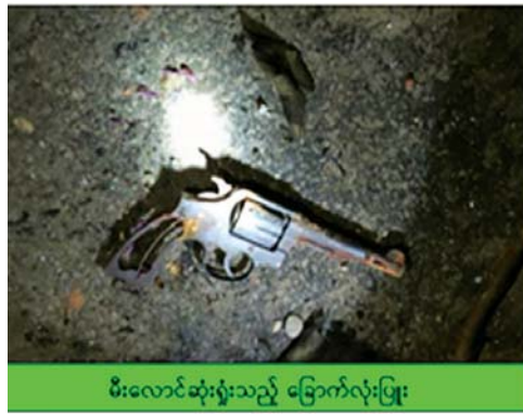
မီးလောင်ဆုံးရှုံးသည့် မြောက်လုံးပြူး

မီးလောင် ပျက်စီးဆုံးရှုံးခဲ့ကာ လုံခြုံရေးတပ်ဖွဲ့ဝင် နှစ်ဦးတွင် ခြေသလုံး၊ ဖခောင့်တို့တွင် ထိခိုက် ဒဏ်ရာအနည်းငယ် ရရှိခဲ့သဖြင့် ဆေးဝါးကုသမှု ခံယူနိုင်ရေး တပ်မတော်ဆေးရုံသို့ ပို့ဆောင် ထားရှိခဲ့သည်။ လုံခြုံရေး တပ်ဖွဲ့ဝင်များကို ပစ်ခတ် တိုက်ခိုက်ခဲ့သူများအား ဖမ်းဆီးရမိနိုင်ရေးအတွက် လိုအပ် သော အင်အားများ ထပ်မံ ဖြည့်တင်းကာ လိုက်လံပိတ်ဆို့ ရှင်းလင်းလျက်ရှိကြောင်း သတင်း ရရှိသည်။