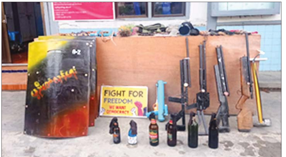
မဟာအောင်မြေမြို့နယ်ရှိ အောင်သိဒ္ဓိဓမ္မာရုံမှ ဆူပူအကြမ်းဖက်ရာတွင် အသုံးပြုမည့် ပစ္စည်းများ သိမ်းဆည်းရမိမှု။