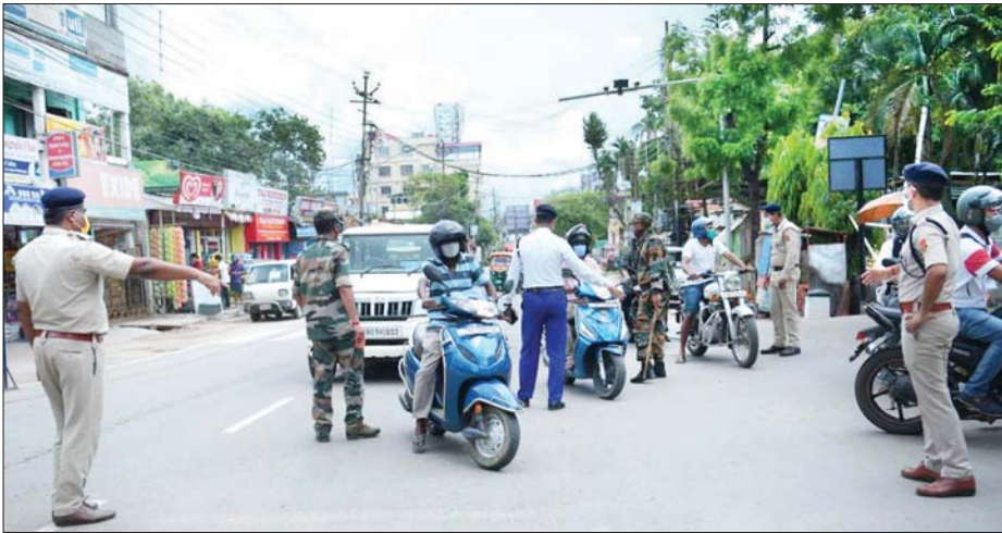
အိန္ဒိယနိုင်ငံ အရှေ့မြောက်ပိုင်း ထရီပူရာပြည်နယ် မြို့တော်ဖြစ်သည့် အာဂါတာလာတွင် ရဲတပ်ဖွဲ့ဝင်များက ခရီးသွားလာသူများကို စစ်ဆေးနေစဉ်။

နယူးဒေလီ မေ ၁၉ - အိန္ဒိယနိုင်ငံတွင် လွန်ခဲ့သော ၂၄ နာရီအတွင်း ကိုဗစ်-၁၉ အတည်ပြု ဖြစ်ပွားသူ ၂၆၇၃၄၄ ဦးရှိကြောင်း ဖော်ပြမှုနှင့်အတူ မေ ၁၉ ရက်က ကိုဗစ် အတည်ပြု လူနာပေါင်း ၂၅၄၉-၆၃၃၀ ရှိလာခဲ့ကြောင်း ကျန်းမာရေးဝန်ကြီးဌာနက အတည်ပြု ဖော်ပြခဲ့သည်။