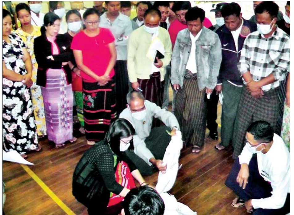
ပင်လောင်းမြို့နယ် ဆန္ဒမဲလက်မှတ် မြေပြင်စစ်ဆေးမှု မှတ်တမ်းဓာတ်ပုံများ။