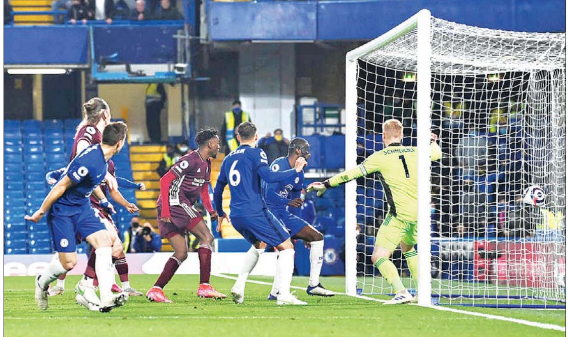
ချယ်ဆီးအသင်းမှ ရူဒီဂါ လက်စတာအသင်းဘက်သို့ ဦးဆောင်ဂိုးသွင်းယူနေမှုကို တွေ့ရစဉ်။

ရန်ကုန် မေ ၁၉ ၂၀၂၁ ခုနှစ်၊ နိုဝင်ဘာလတွင် ဗီယက်နမ်နိုင်ငံ၌ အိမ်ရှင်အဖြစ် လက်ခံကျင်းပမည့် (၃၁) ကြိမ်မြောက် အရှေ့တောင်အာရှအားကစားပြိုင်ပွဲတွင် ပါဝင်ယှဉ်ပြိုင်အောင်မြင်မှုရရှိစေရန်အတွက် မြန်မာအားကစားအဖွဲ့များအား ရန်ကုန်မြို့နှင့် နေပြည်တော်တို့တွင် စခန်းသွင်းလေ့ကျင့်လျက်ရှိရာ ကျန်းမာရေးနှင့် အားကစားဝန်ကြီးဌာန ပြည်ထောင်စုဝန်ကြီး၊ ဒုတိယဝန်ကြီးတို့၏ လမ်းညွှန်ချက်နှင့်အညီ ရန်ကုန်မြို့၌ စခန်းသွင်းလေ့ကျင့်လျက်ရှိသည်။ စာမျက်နှာ ၁၂ ကော်လံ ၁ *