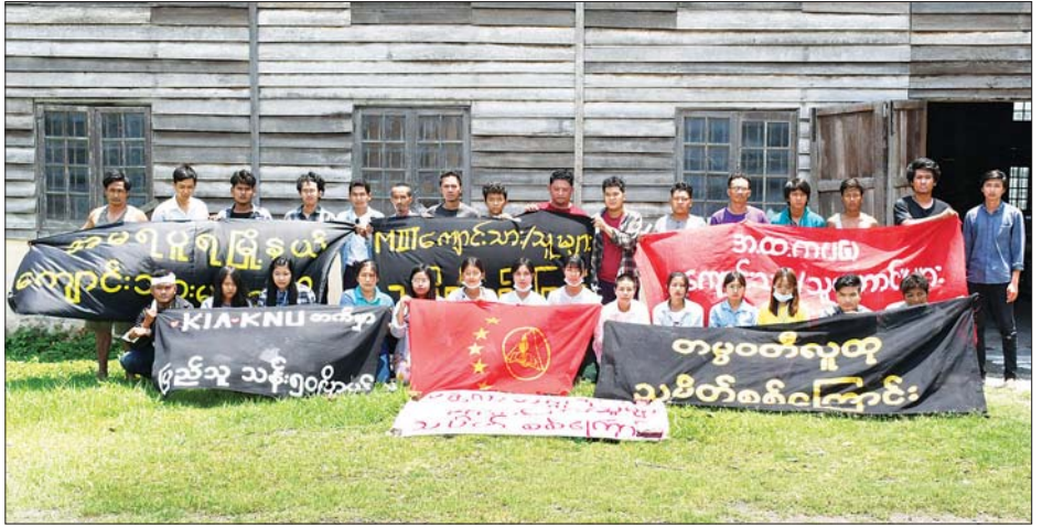
ပြည်ကြီး သိရသည်။ အဆိုပါဖမ်းဆီးထိန်းသိမ်းခံရသူများအား လက်ထုံးလုပ်နည်းနှင့် အညီ ထိရောက်စွာအရေးယူသွားမည်ဖြစ်ကြောင်းနှင့် ဆူပူဆန္ဒပြရာတွင်ပါဝင်ပတ်သက်သူများအား အမြန်ဆုံးဖမ်းဆီးရမိရေးဆက်လက်ဆောင်ရွက်သွားမည်ဖြစ်ကြောင်း သတင်းစဉ်

သိရှိရသဖြင့် လုံခြုံရေးတပ်ဖွဲ့ဝင်များက လူစုလူဝေးဖြိုခွဲရေးလုပ်ထုံးလုပ်နည်းများနှင့်အညီ လူစုခွဲဆောင်ရွက်ခဲ့ရာ ဆူပူဆန္ဒပြသူများအနက်မှ အမျိုးသား ၁၉ ဦး၊ အမျိုးသမီး ၁ ဦးတို့ကို လက်လုပ်သေနတ်သုံးလက်၊ လက်လုပ်မိုင်းနှစ်လုံး၊ မီးပုလင်းနှစ်ပုလင်း၊ ဒိုင်းနှစ်ခု၊ ဆူပူဆန္ဒပြရာတွင် အသုံးပြုသည့် အခြားဆက်စပ်ပစ္စည်းများနှင့်အတူ ဖမ်းဆီးထိန်းသိမ်းနိုင်ခဲ့