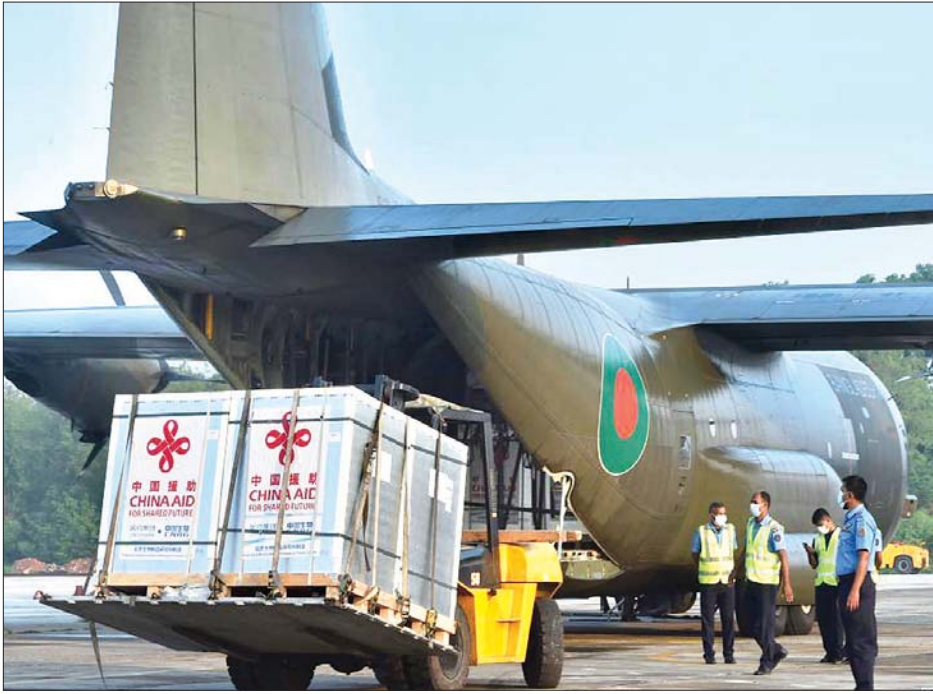
တရုတ်နိုင်ငံမှ လှူဒါန်းလိုက်သော ကိုဗစ်-၁၉ ကာကွယ်ဆေးများကို တွေ့ရစဉ်။