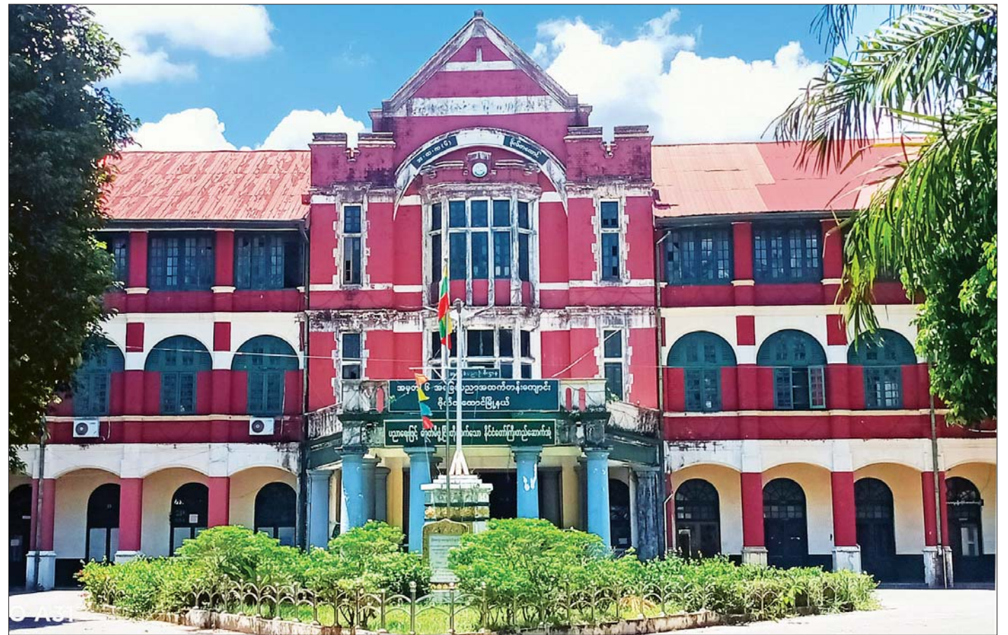
ရန်ကုန်မြို့ ဗိုလ်တထောင်မြို့နယ်ရှိ အထက-၆ (ယခင်စိန့်ပေါလ်ကျောင်း) ကို တွေ့ရစဉ်။

ရန်ကုန်တိုင်းဒေသကြီးအတွင်းရှိ အခြေခံပညာအထက်တန်း၊ အလယ်တန်းနှင့် မူလတန်းကျောင်းများအားလုံး ပညာရေးဝန်ကြီးဌာန လမ်းညွှန်မှု၊ ကျန်းမာရေးနှင့် အားကစားဝန်ကြီးဌာန၏ ကိုဗစ်-၁၉ ကပ်ရောဂါကာကွယ်ထိန်းချုပ်ရေး လမ်းညွှန်ချက်များနှင့်အညီ လာမည့် ၂၀၂၁-၂၀၂၂ ပညာသင်နှစ်တွင် ဖွင့်လှစ်သင်ကြား နိုင်ရေး ဆောင်ရွက်လျက်ရှိရာ ယခုအခါ ထက်၊ လယ်၊ မူကျောင်းများအားလုံး အခက်အခဲမရှိ ဖွင့်လှစ်သင်ကြားနိုင်ရေး အဆင်သင့်ဖြစ်နေပြီဖြစ်ကြောင်း ရန်ကုန်တိုင်း ဒေသကြီး ပညာရေးမှူးရုံးမှ သိရသည်။ စာမျက်နှာ ၄ ကော်လံ ၁ *