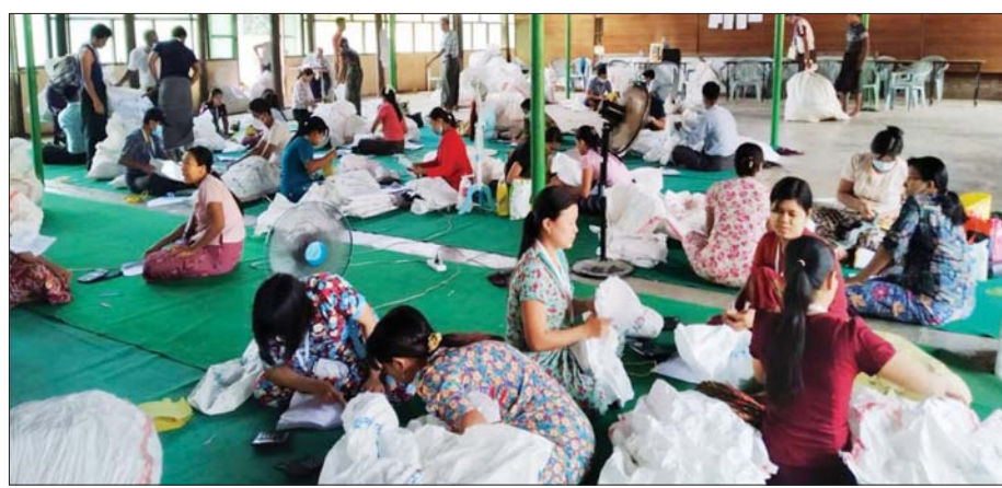
ငမဲမြို့နယ် ဆန္ဒမဲလက်မှတ် မြေပြင်စစ်ဆေးမှုမှတ်တမ်းဓာတ်ပုံ။

၅။ မြေပြင်စစ်ဆေးချက်များအရ အဆိုပါ ၇ မြို့နယ်တွင် မဲရုံပေါင်း ၁၂၁၄ ရုံ၊ စုစုပေါင်း ထုတ်ယူ ရရှိခဲ့သော ဆန္ဒမဲလက်မှတ်အရေအတွက်မှာ ၉၈၆၂၁၁ ဖြစ်ပြီး မဲပေးအသုံးပြုခဲ့သော လက်မှတ် ဖြတ်ပိုင်းများမှာ ၆၇၀၂၅၁ ၊ ကျန်ရှိရမည့်အရေအတွက်မှာ ၃၁၅၉၆၀ ၊ မြေပြင်လက်ကျန် ၂၉၅၀၁၀ ဖြစ်ကြောင်း စိစစ်တွေ့ရှိရသည်။ ကွာခြားချက်အနေဖြင့် ကျန်ရှိရမည့် အရေအတွက်ထက် လျော့နည်းသော မဲလက်မှတ်အရေအတွက် ၂၅၅၈၁ ဖြစ်ပြီး၊ အပိုတွေ့ရှိသော မဲလက်မှတ်အရေအတွက်မှာ ၁၇၂၂ ဖြစ်သည်။ မြို့နယ်အလိုက် ဆန္ဒမဲလက်မှတ်များ လျော့နည်းပျောက်ဆုံးခြင်း၊ တရားမဝင် အပိုရရှိနေခြင်းတို့ကို တွေ့ရှိရသည်။ မြို့နယ်တစ်မြို့နယ်ချင်းအလိုက် စိစစ်တွေ့ရှိချက်များမှာ အောက်ပါအတိုင်း ဖြစ်သည်-