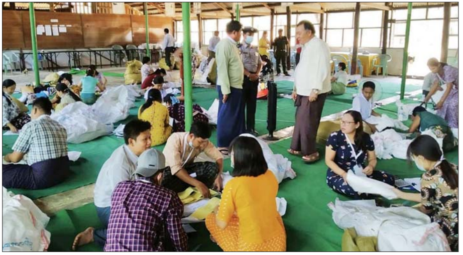
စလင်းမြို့နယ် ဆန္ဒမဲလက်မှတ် မြေပြင်စစ်ဆေးမှုမှတ်တမ်းဓာတ်ပုံ။

မြို့နယ်အလိုက် ပြည်သူ့လွှတ်တော်ဆန္ဒမဲလက်မှတ်များ မြေပြင်စစ်ဆေးတွေ့ရှိချက်