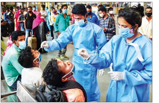
အိန္ဒိယနိုင်ငံတွင် ကိုဗစ်-၁၉ စစ်ဆေးရန် တို့ဖတ်နမူနာများကို ဆေးဘက်ဆိုင်ရာကျွမ်းကျင်သူများက ရယူနေသည်ကို တွေ့ရစဉ်။

နယူးဒေလီ မေ ၁၂ အိန္ဒိယနိုင်ငံတွင် နေ့စဉ်ကိုဗစ်-၁၉ သေဆုံးမှုစံချိန်တင် မြင့်တက် လျက်ရှိကြောင်း ဖော်ပြမှုနှင့်အတူ အရှိန်အဟုန်မပျက် ကိုဗစ်-၁၉ ကူးစက်မှုများ ဆက်လက် ဖြစ်ပွားနေသောကြောင့် ကျန်းမာရေးစနစ်လည်း ယိုင်နဲ့လျက် ရှိသည်။ အိန္ဒိယအစိုးရက မေ ၁၂ ရက်က ကိုဗစ်-၁၉ ကူးစက်ဖြစ်ပွားသူ ၃၄၈၄၂ ဦးရှိပြီး သေဆုံးသူ ၄၂၀၅ ဦးရှိကြောင်း ဖော်ပြခဲ့သည်။ ကိုဗစ်-၁၉ ကူးစက်ဖြစ်ပွားမှုများသည် မြို့တော် နယူးဒေလီနှင့် စီးပွားရေးမြို့တော် မွမ်ဘိုင်ကဲ့သို့ သော မြို့ကြီးများမှတစ်ဆင့် ကျန်းမာရေးစနစ် အဆင့်မမီသော ပြည်နယ်မြို့များနှင့် ကျေးလက်ဒေသများသို့ ကူးစက်ဖြစ်ပွား လျက်ရှိသည်။ နိုင်ငံ၏ ဒေသအတော်များတွင် ရောဂါမရှိသော ပုံပိုးမှု အခြေအနေများနှင့် အောက်ဆီဂျင် ပြတ်လပ်မှုများကြား ရုန်းကန်ဖြေရှင်းနေရသည်။ ဂျပန်နိုင်ငံက အောက်ဆီဂျင် စက် ၁၀၀ အပါအဝင် ဒုတိယအကြိမ် အရေးပေါ်အကူအညီပေးပို့မှုကို အိန္ဒိယနိုင်ငံက လက်ခံရရှိတော့မည်ဖြစ်သည်။ ထို့အပြင် ဂျပန်နိုင်ငံသည် အိန္ဒိယနိုင်ငံသို့ အသက်ရှူအထောက်အကူပြု ကိရိယာများ ပေးပို့ရန်လည်း စီစဉ်ထားကြောင်း သိရသည်။