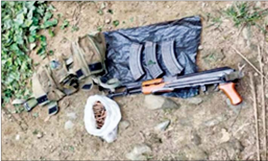
လုံခြုံရေးတပ်ဖွဲ့ဝင်များ အနေဖြင့် နယ်စပ်ဒေသလုံခြုံရေးနှင့် တည်ငြိမ်အေးချမ်းရေး လုပ်ငန်းများကို ဆက်လက်ဆောင်ရွက်လျက်ရှိကြောင်း သတင်းရရှိသတင်းစဉ်

ထိုသို့ ဆောင်ရွက်လျက်ရှိစဉ် မောင်တောမြို့နယ် အတွင်းနှင့် နယ်စပ်မျဉ်းတစ်လျှောက် လုံခြုံရေးဆောင်ရွက်နေသည့် နယ်ခြားစောင့်ရဲတပ်ဖွဲ့ဝင်များသည် ယနေ့နံနက် ၇ နာရီခွဲခန့်တွင် မြန်မာ-ဘင်္ဂလားဒေ့ရှ် နယ်စပ်မှတ်တိုင်အမှတ် ဘီပီ - ၅၁ နှင့် ၅၂ ကြား နေရာသို့အရောက် နယ်စပ်ခြံစည်းရိုးကို ဖြတ်ကျော်၍ ဖြစ်စဉ်တွင် အနက်ရောင် ဘင်္ဂလားဒေ့ရှ် နိုင်ငံဘက်ခြမ်းမှ တီရပ်လက်ရှည်နှင့် အားကစား