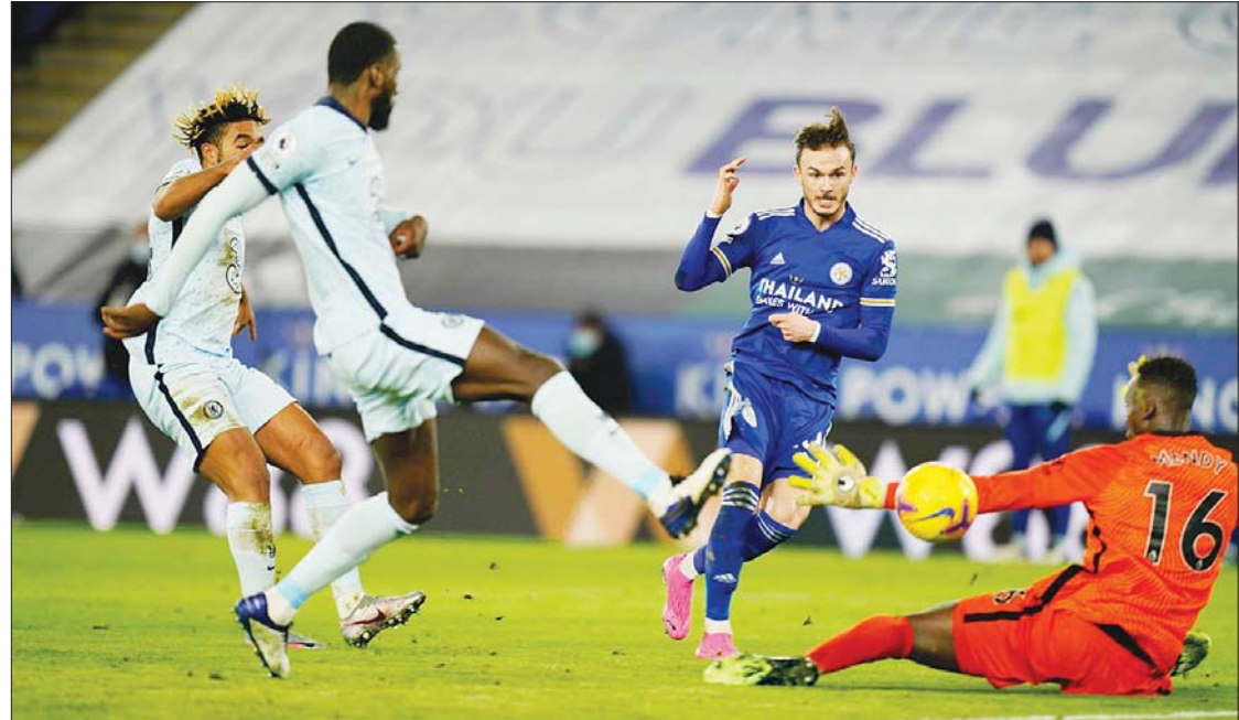
ချယ်ဆီးအသင်းနှင့် လက်စတာအသင်းတို့ ပရီမီယာလိဂ်ပထမအကျော့ တွေ့ဆုံယှဉ်ပြိုင်စဉ်။