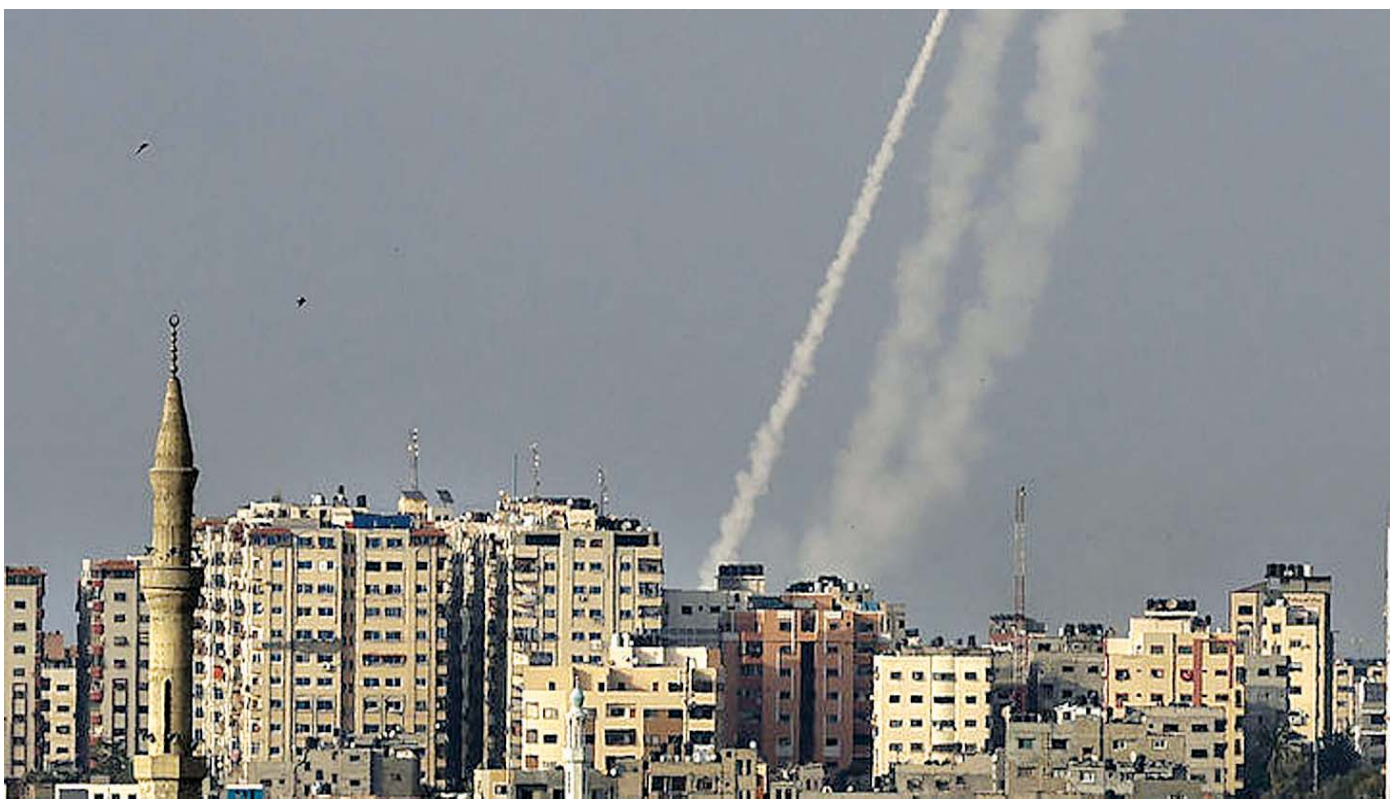
ပါလက်စတိုင်းဘက်မှ အစ္စရေးသို့ ဦးတည်ကာ ပစ်ခတ်မှုများပြုလုပ်နေသည်ကို တွေ့ရစဉ်။

နောက်ဆုံး သတ်မှတ်ထားသည့်အချိန် ကျော်သွားပြီးသည့်နောက် ဟားမားစ်တို့က ဂျေရုဆလင်ကိုဦးတည်ကာ ခုံးကျည်ခွဲပစ်ခတ်ခဲ့သည်ဟု အစ္စရေးတပ်ဖွဲ့မှ ပြောသည်။ အစ္စရေးနိုင်ငံ တောင်ပိုင်းသို့ ဦးတည်ပြီးလည်း ရာနှင့်ချီသည့် ခုံးကျည်များပစ်ခတ်ခဲ့သည်ဟု အစ္စရေးတပ်ဖွဲ့မှ ပြောသည်။ ပါလက်စတိုင်းတို့နှင့် အစ္စရေးရဲများ ထိပ်တိုက် ပဋိပက္ခဖြစ်ပွားခဲ့ရာ အယ်အက်ဆက် ဘာသာရေးအဆောက်အအုံဝင်းမှာ ဂျေရုဆလင် မြို့ဟောင်းတွင်ရှိပြီး အစ္စရေးတရားရုံးမှာ ပါလက်စတိုင်းမိသားစုအချို့ကို ဂျေရုဆလင်အရှေ့ပိုင်း ရှိတ်ခါဂျာရာမှ နှင်ထုတ်ရန် ကြိုးစားပြီးနောက် တင်းမာမှုများ ပေါ်ပေါက်ခဲ့ခြင်းဖြစ်သည်။ တင်းမာမှုများ မြင့်မားလာမှုနှင့်အတူ ယင်းနေရာမှ ပါလက်စတိုင်းမိသားစုများကို နှင်ထုတ်ခြင်းကိစ္စ ကြားနာမှုကို ရွှေ့ဆိုင်းဖွယ်ရှိသည်ဟု အစ္စရေးတရားရေး ဝန်ကြီးဌာနက မေ ၉ ရက်တွင် ပြောကြားခဲ့သည်။