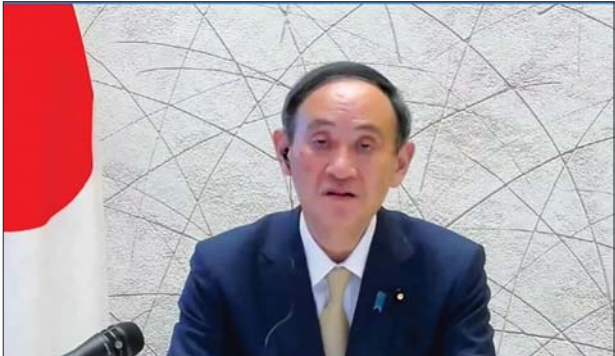
ဂျပန်ဝန်ကြီးချုပ် ဆူဂါယိုရှိဟိဒဲ ကမ္ဘာ့စီးပွားရေးဖိုရမ်တွင် မိန့်ခွန်းပြောနေသည်ကို တွေ့ရစဉ်။

ဘန်ကောက် မေ ၁၂ ထိုင်းနိုင်ငံတွင် မေ ၁၂ ရက်က ကိုဗစ်-၁၉ ကပ်ရောဂါဖြင့် ထပ်မံသေဆုံးသူ ၃၄ ဦးတိုးလာကြောင်း မှတ်တမ်းတင် ဖော်ပြပြီးနောက် နိုင်ငံအတွင်း ကိုဗစ်-၁၉ ကပ်ရောဂါဖြင့် သေဆုံးသူပေါင်းသည် ၄၈၆ ဦးရှိအထိရောက်ရှိလာခဲ့သည်။ ထို့အပြင် နိုင်ငံအတွင်း ကိုဗစ်-၁၉ ထပ်မံကူးစက်ဖြစ်ပွားသူ ၁၉၈၃ ဦးရှိလာကြောင်း ကိုဗစ်-၁၉ ထိန်းချုပ်ရေးဌာနက သတင်းထုတ်ပြန်လိုက်သည်။ အသစ်ထပ်မံကူးစက်ဖြစ်ပွားမှုများအနက် ၁၉၇၄ ဦးမှာ ပြည်တွင်းကူးစက်မှုဖြစ်ကာ ကိုးဦးမှာ နိုင်ငံခြားကူးစက်မှုဖြစ်ပွားမှုဖြစ်ကြောင်း ကိုဗစ်-၁၉ ထိန်းချုပ်ရေးဌာန ပြောရေးဆိုခွင့်ရှိသူ အဝိဆာမိုင်က ပြောသည်။ ကိုဗစ်-၁၉ ထပ်မံကူးစက်ဖြစ်ပွားသူများကို ထပ်မံ ပေါင်းထည့်လိုက်ပါက နိုင်ငံအတွင်းရှိ ကိုဗစ်-၁၉ ကူးစက်မှုဖြစ်ပွားသူပေါင်းသည် ၈၈၉၀ ဦးအထိ ရောက်ရှိလာပြီး ဧပြီလအစောပိုင်းကထက် သုံးဆပိုများလာခဲ့သည်။ ယခုအခါတွင် ကိုဗစ်-၁၉ လူနာပေါင်း ၂၉၃၇၈ ဦးဆေးရုံများတွင် ဆေးကုသမှု ခံယူလျက်ရှိကြောင်း ၎င်းတို့အနက် ၁၂၂၆ ဦးမှာ ပြင်းထန်သောအခြေအနေဖြစ်ကြောင်း သိရသည်။ ဆင်ဟွာ