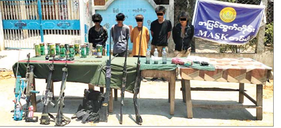
ဆူပူအကြမ်းဖက်သူ အမျိုးသား ငါးဦး၊ အမျိုးသမီး တစ်ဦးနှင့် ဆူပူအကြမ်းဖက်ရာတွင် အသုံးပြုသည့် လက်နက်ငယ်၊ လက်လုပ်သေနတ်၊ တူမီးသေနတ်၊ လက်ပစ်ဗုံးနှင့် လက်လုပ်ဗုံးများ သိမ်းဆည်းရမိစဉ်။

အတွင်း အရောက်တွင် လုံခြုံရေးတပ်ဖွဲ့ဝင်များအား ဆူပူအကြမ်းဖက်သူ အင်အား ၂၀၀ ခန့်က လက်နက် ငယ်၊ တူမီးသေနတ်၊ လက်ပစ်ဗုံး၊ လက်လုပ်ဗုံးများ ဖြင့် ပိုင်းရိပ်တိုက်ခိုက် ဆူပူအော်ဟစ်အကြမ်းဖက် တိုက်ခိုက်ခဲ့ကြသဖြင့် လုံခြုံရေးတပ်ဖွဲ့ဝင်များက မလွဲမရှောင်သာ လုပ်ထုံးလုပ်နည်းနှင့်အညီ လူစု ခွဲခြားဆောင်ရွက်ခဲ့ရာ နံနက် ၁၀ နာရီခန့်တွင် ဆူပူအကြမ်းဖက်အဖွဲ့များ ဆင်ချောင်းကျေးရွာ ဘက်သို့ ပြန်လည်ဆုတ်ခွာ ထွက်ပြေးသွားခဲ့သည်။ အဆိုပါထိတွေ့မှုဖြစ်စဉ်အတွင်း လုံခြုံရေးတပ်ဖွဲ့ ဝင် နှစ်ဦး ကျည်ထိမှန်၍ အပြင်းအထန်ဒဏ်ရာများ ရရှိခဲ့ပြီး ဆူပူအကြမ်းဖက်သူ အမျိုးသား ငါးဦး၊ အမျိုးသမီးတစ်ဦးတို့အား ဆူပူအကြမ်းဖက်တိုက်ခိုက် ရာတွင် အသုံးပြုခဲ့သည့် M-16 မောင်းပြန်ရိုင်းဖယ် နှစ်လက်၊ တူမီးသေနတ်နှစ်လက်၊ လက်လုပ်သေနတ် ရှစ်လက်၊ 91 လက်ပစ်ဗုံး တစ်လုံးတို့နှင့်အတူ ဖမ်းဆီး ရမိခဲ့သည်။ အထက်ပါဖြစ်စဉ်တွင် ဖမ်းဆီးရမိခဲ့သည့် ဆူပူ အကြမ်းဖက်သူများအား ဥပဒေနှင့်အညီ ထိရောက် စွာအရေးယူနိုင်ရေး ဆက်လက်ဆောင်ရွက်လျက်ရှိပြီး တလုပ်မြို့ကျေးရွာ၏ ပတ်ဝန်းကျင်ကျေးရွာများရှိ ဆူပူအကြမ်းဖက်အဖွဲ့များအား ဆက်လက်ဖော်ထုတ် ဖမ်းဆီးရမိနိုင်ရေးအတွက် ရပ်ရွာအေးချမ်းသာယာ ရေးနှင့် တရားဥပဒေစိုးမိုးရေးကို ရှေးရှုကာ အရှိန် အဟုန်ဖြင့် ဆက်လက်ဆောင်ရွက်သွားမည်ဖြစ် ကြောင်း သတင်းရရှိသည်။ သတင်းစဉ်