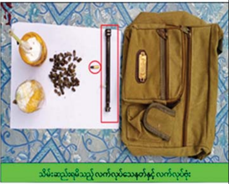
သိမ်းဆည်းရမိသည့် လက်လုပ်သေနတ်နှင့် လက်လုပ်ဗုံး

ပေါက်ကွဲခဲ့ပြီး ပေါက်ကွဲမှုကြောင့် မီးသတ်ယာဉ် တစ်စီး၏ ရှေ့လေကာမှန် ကွဲအက်ပျက်စီးခဲ့ကာ လုံခြုံရေးတပ်ဖွဲ့ဝင် ခုနစ်ဦးနှင့် မီးသတ်တပ်ဖွဲ့ဝင် နှစ်ဦးတို့တွင် လက်မောင်း၊ ပခုံး၊ တင်ပါး၊ ပေါင်၊ ခြေသလုံးတို့တွင် ထိခိုက်ဒဏ်ရာများ အသီးသီးရရှိ ခဲ့ကြောင်း သိရသည်။