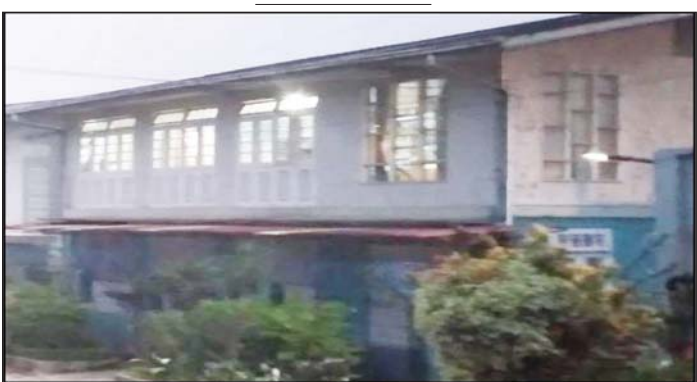
ဒေါက်တာ အောင်ပြည့်သူ (အထူးကု၊ မိုးကုတ်ပြည်သူ့ဆေးရုံ) ဆေးကုသနေသည့် အမည်မရှိ ဆေးခန်းမှတ်တမ်းဓာတ်ပုံ