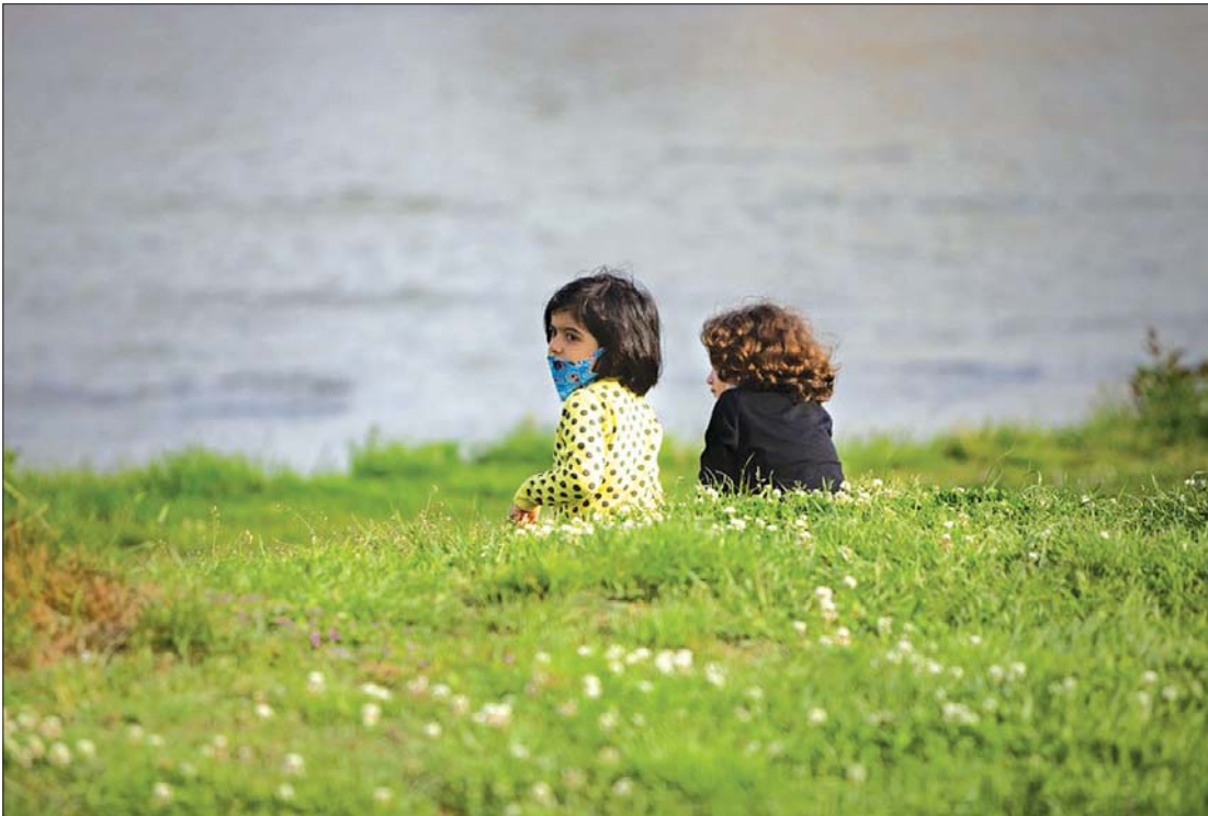
အီရန်နိုင်ငံရှိ ပန်းခြံတစ်ခုအတွင်းထိုင်နေသည့် ကလေးငယ်နှစ်ဦးကို တွေ့ရစဉ်။

တူရကီနိုင်ငံသည် ရုရှားနိုင်ငံထုတ် Sputnik-V ကိုဗစ်-၁၉ ကာကွယ်ဆေးကို ပြီးခဲ့သည့် သီတင်းပတ်အတွင်းက အရေးပေါ်သုံးစွဲခွင့်အတွက် အတည်ပြု ပေးခဲ့သည်။ Sputnik-V ကာကွယ်ဆေး အလုံးရေ သန်း ၅၀ ဝယ်ယူရန်အတွက် သဘောတူ လက်မှတ်ရေးထိုးပြီးနောက် အတည်ပြုပေးခဲ့ခြင်း ဖြစ်သည်။ ပထမ အသုတ်ပေးပို့မှုမှာ မေလအတွင်း စတင်