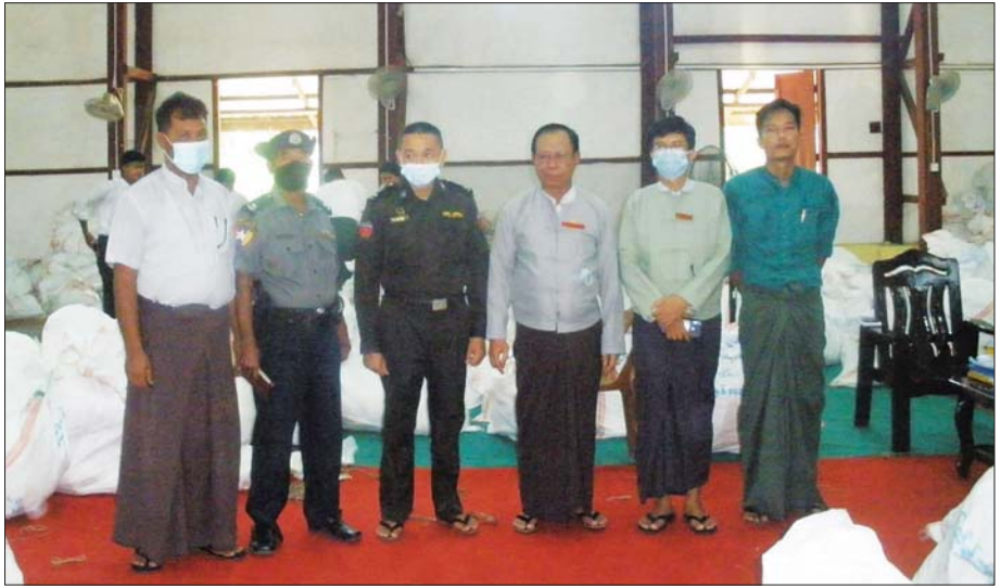
ထားဝယ်မြို့နယ် ဆန္ဒမဲလက်မှတ် မြေပြင်စစ်ဆေးမှုမှတ်တမ်းဓာတ်ပုံ။

၆။ ထားဝယ်မြို့နယ်၊ ရပ်ကွက် ၁၈ ရပ်ကွက်၊ ကျေးရွာအုပ်စု ၂၅ အုပ်စုရှိ မဲရုံ ၁၀၄ ရုံတို့တွင် မဲလက်မှတ် အရေအတွက် ၇၄၃၈ ပျောက်ဆုံးနေပြီး မဲလက်မှတ် ၄၄၀၀ အပိုတွေ့ရှိရသည်။ ထားဝယ်မြို့နယ် ပြည်သူ့ လွှတ်တော်ဆန္ဒမဲလက်မှတ်များ ရပ်ကွက်/ကျေးရွာအုပ်စုအလိုက် မြေပြင်စစ်ဆေး တွေ့ရှိချက်မှာ အောက်ပါအတိုင်းဖြစ်ပါသည်-