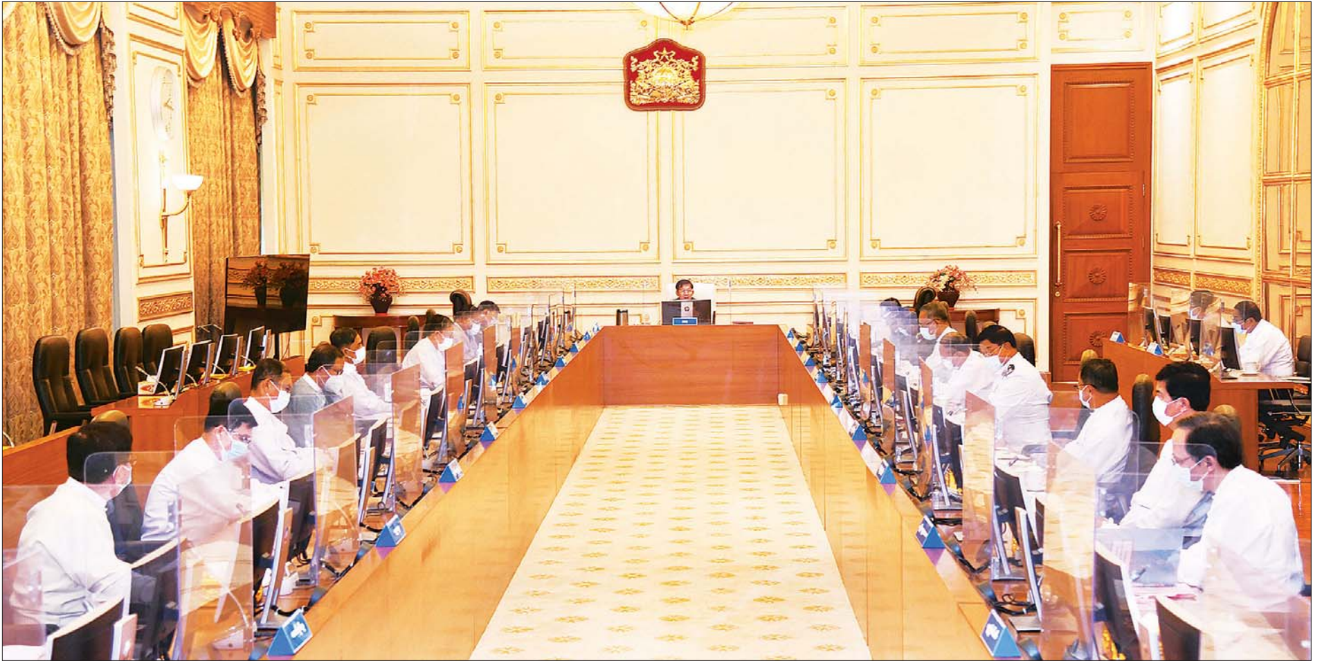
နိုင်ငံတော်စီမံအုပ်ချုပ်ရေးကောင်စီဥက္ကဋ္ဌ၊ တပ်မတော်ကာကွယ်ရေးဦးစီးချုပ် ဗိုလ်ချုပ်မှူးကြီး မင်းအောင်လှိုင် နိုင်ငံတော်စီမံအုပ်ချုပ်ရေးကောင်စီ စီမံခန့်ခွဲရေးကော်မတီအစည်းအဝေး (၆/၂၀၂၁) တွင် အမှာစကားပြောကြားစဉ်။