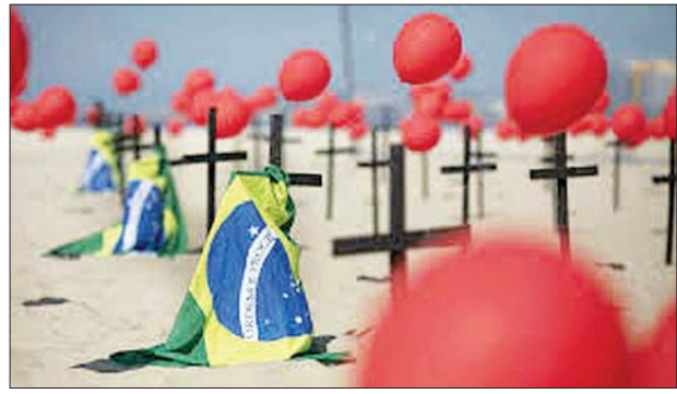
ဘရာဇီးနိုင်ငံ ရီယိုဒီဂျနေရိုးရှိ ကိုပါကာဘာနာကမ်းခြေ သဲသောင်ပြင်ပေါ်တွင် ကိုဗစ်-၁၉ ကြောင့် သေဆုံးသွားသူများအတွက် အောက်မေ့ဖွယ် အနီရောင်ဘောလုံးများ၊ ဘရာဇီးအလံများနှင့် လက်ဝါးကပ်တိုင်များကို စိုက်ထူထားသည်ကို တွေ့ရစဉ်။

ရီယိုဒီဂျနေရိုး မေ ၆ ဘရာဇီးနိုင်ငံတွင် လွန်ခဲ့သော ၂၄ နာရီအတွင်း ကိုဗစ်-၁၉ ဖြင့် ထပ်မံသေဆုံးသူ ၂၅၀၁ ဦးရှိလာကြောင်း မှတ်တမ်းတင်ဖော်ပြခြင်းအပါအဝင် စုစုပေါင်းသေဆုံးသူ ၄၁၄၃၉၉ ဦးရှိလာပြီဖြစ်ကြောင်း ကျန်းမာရေး