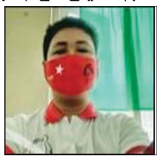
ဒေါက်တာ အောင်ပြည့်သူ

အဆိုပါအမှုဖွင့်လှစ်ထားသော ဆရာဝန်များအား ဖမ်းဆီးရမိရေးဆောင်ရွက်လျက်ရှိရာ လက်ခံထားသူများအား တရားဥပဒေအရ အရေးယူဆောင်ရွက်သွားမည့်အပြင် ၎င်းတို့ကိုယ်တိုင်လက်ခံ၍ ဆေးကုသခွင့်ပေးထားသည့် ပြင်ပပုဂ္ဂလိက ဆေးရုံ/ဆေးခန်းများကိုလည်း လုပ်ငန်းလိုင်စင် ပိတ်သိမ်းသွားမည်ဖြစ်ကြောင်း၊ ဆေးရုံ/ဆေးခန်းပိုင်ရှင်များကိုလည်း တရားဥပဒေအရ ထိရောက်စွာ အရေးယူဆောင်ရွက်သွားမည်ဖြစ်ကြောင်းနှင့် မည်သည့်ကျန်းမာရေးဝန်ထမ်းမဆို တာဝန်ကျရာဆေးရုံများ၌ CDM လှုပ်ရှားမှုတွင် ပါဝင်ကာ မူလတာဝန်များထမ်းဆောင်ခြင်းမရှိဘဲ အခြားပြင်ပပုဂ္ဂလိက ဆေးရုံ/ဆေးခန်းများသို့ သွားရောက်၍ အခကြေးငွေရယူ ဆေးကုသခြင်း၊ ကူညီလုပ်ဆောင်ခြင်းများ ပြုလုပ်ပါကတရားဥပဒေနှင့်အညီ အရေးယူဆောင်ရွက်သွားမည်ဖြစ်ကြောင်း၊ အဆိုပါ ဆရာဝန်များနှင့် ကျန်းမာရေးဝန်ထမ်းများအား လက်ခံထားသည့် ပုဂ္ဂလိက ဆေးရုံ/ ဆေးခန်းပိုင်ရှင်များအား CDM လှုပ်ရှားမှု၌ ပါဝင်သူများကို ထောက်ခံအားပေးခြင်းအရ ထိရောက်စွာအရေးယူသွားမည်ဖြစ်ကြောင်း အသိပေးကြေညာအပ်ပါသည်။ သတင်းစဉ်