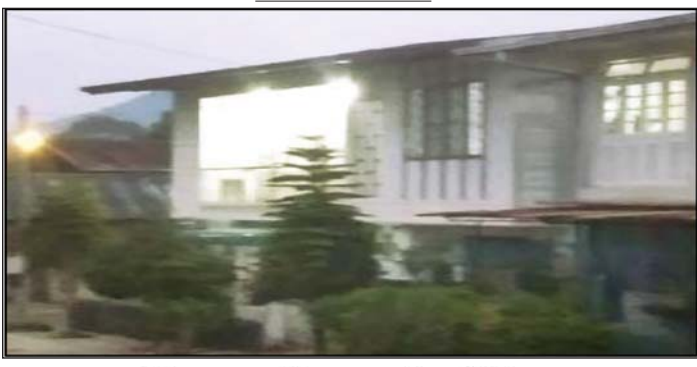
ဒေါက်တာ သန္တာစုလှိုင် (အထူးကု ၊ မိုးကုတ်ပြည်သူ့ဆေးရုံ) ဆေးကုသနေသည့် အမည်မရှိ ဆေးခန်းမှတ်တမ်းဓာတ်ပုံ