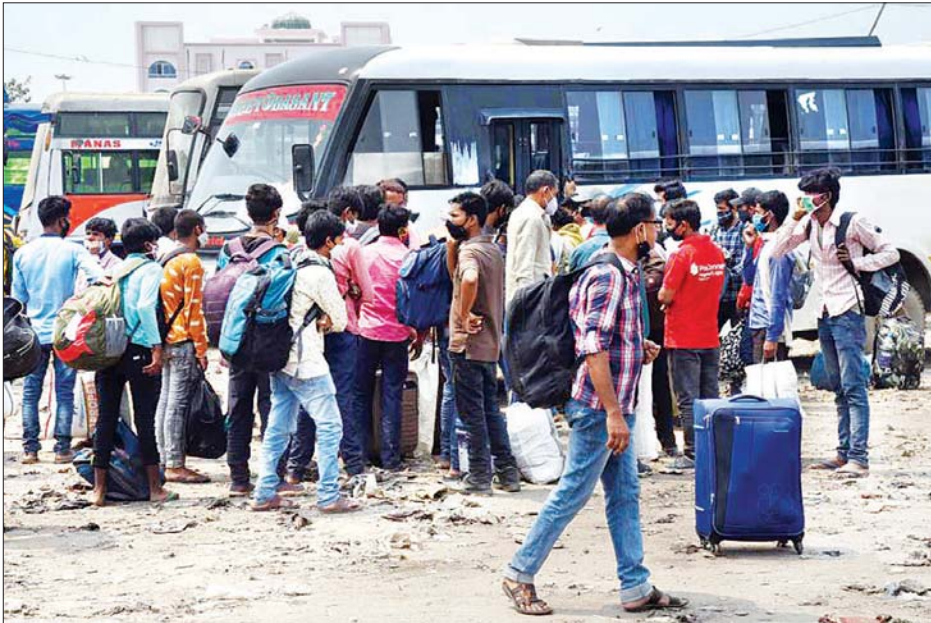
အိန္ဒိယနိုင်ငံ ပတ္တနာရှိ ဘတ်စ်ကားဂိတ်တစ်ခုတွင် အိမ်ပြန်ရန်စောင့်နေသော အလုပ်သမားများကို တွေ့ရစဉ်။

နယူးဒေလီ မေ ၆ အိန္ဒိယနိုင်ငံတစ်ဝန်း မေ ၅ ရက်က ကိုဗစ်-၁၉ အတည်ပြုလူနာ ၄၁၂၆၂ ဦးရှိကြောင်း အတည်ပြုဖော်ပြမှုနှင့်အတူ အိန္ဒိယနိုင်ငံ၏ ကိုဗစ်-၁၉ ကူးစက်ဖြစ်ပွားမှုသည် မေ ၆ ရက်တွင် ၂၁ သန်းကျော်လွန်လာပြီဖြစ်ကြောင်း ကျန်းမာရေးဝန်ကြီးဌာနက သတင်းထုတ်ပြန်ဖော်ပြလိုက်သည်။