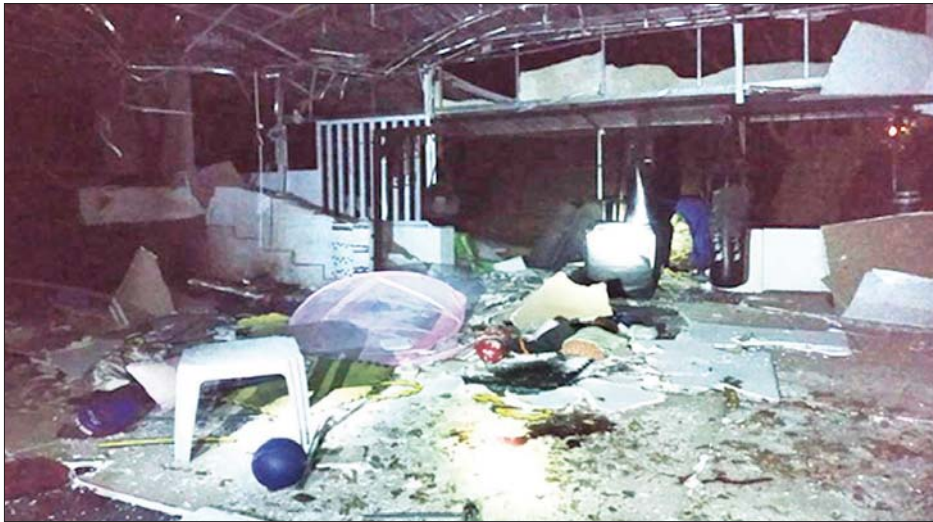
ဗဟန်းမြို့နယ် ဗိုလ်ချုပ် (၂)ရပ်ကွက် နတ်မောက်လမ်း ဗိုလ်ချုပ်ပန်းခြံအတွင်းရှိ Team PT အားကစား ခန်းမအတွင်း ပေါက်ကွဲမှုဖြစ်ပွားခဲ့သည်ကို တွေ့ရစဉ်။

ထိုသို့ စစ်ဆေးမှုများ ဆောင်ရွက်စဉ် ဒဏ်ရာ ရရှိသူအား ဆေးရုံသို့ လိုက်ပါ ပို့ဆောင်သော Honda STEP WGN အမျိုးအစား MDY 11/----- မော်တော် ယာဉ်အတွင်းမှ အလျားခြောက်လက်မခန့်၊ အချင်း တစ်လက်မခန့်ရှိ PVC ပိုက်ဖြင့် ပြုလုပ်ထားသော