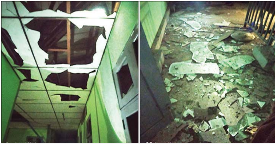
မင်္ဂလာဒုံမြို့နယ် အမှတ်(၈) အခြေခံပညာမူလတန်းကျောင်း၌ လက်လုပ်မိုင်းပေါက်ကွဲမှုကို တွေ့ရစဉ်။

တိုင်းဒေသကြီး အောင်မြေသာစံမြို့နယ် အနိပ်တော်ရပ်ကွက်ရှိ နိုင်ငံခြားဘာသာတက္ကသိုလ်အနီး၌ လည်းကောင်း၊ နံနက် ၁၁ နာရီ ၅ မိနစ်တွင် ပြည်ကြီးတံခွန်မြို့နယ် (၈)ရပ်ကွက်ရှိ အမှတ်(၂၉) အခြေခံပညာအထက်တန်းကျောင်းကို လည်းကောင်း၊ မွန်းလွဲ ၁၂ နာရီခွဲတွင် ပုသိမ်ကြီးမြို့နယ် ကျီးကုန်းလမ်းဆုံမီးပွိုင့်ရှိ အချက်ပြမီးထိန်းချုပ်ရေးအဆောက်အအုံကို လည်းကောင်း၊ ဆူပူအကြမ်းဖက်သူများက လက်လုပ်ဗုံးများ၊ လက်ပစ်ဗုံးများဖြင့် ပစ်ခတ်ခဲ့ရာ ပေါက်ကွဲမှုများကြောင့် နေအိမ်အဆောက်အအုံ၊ ရုံးများနှင့် စာသင်ကျောင်းများ အနည်းငယ်ထိခိုက်ပျက်စီးခဲ့ပြီး လူထိခိုက်ဒဏ်ရာရရှိမှု မရှိကြောင်းနှင့် ဒဂုံမြို့သစ်(မြောက်ပိုင်း) မြို့နယ် ဖြစ်စဉ်၌ ဆူပူအကြမ်းဖက်သူ တစ်ဦးကို