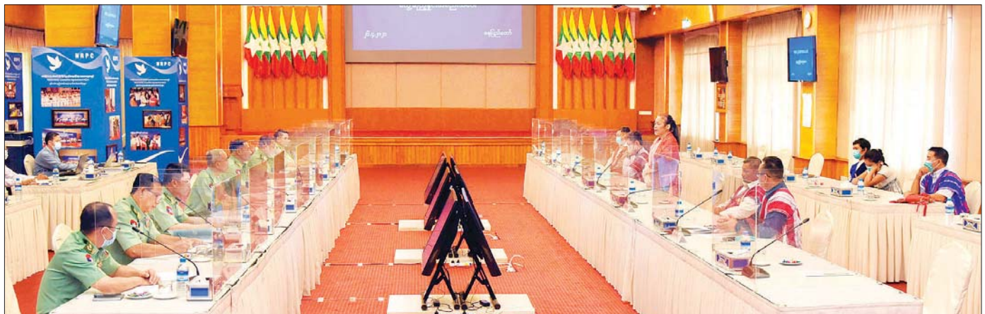
အမျိုးသားစည်းလုံးညီညွတ်ရေးနှင့် ငြိမ်းချမ်းရေးဖော်ဆောင်မှု ညှိနှိုင်းရေးကော်မတီနှင့် ကရင်အမျိုးသားအစည်းအရုံး/ ကရင်အမျိုးသား လွတ်မြောက်ရေးတပ်မတော် - ငြိမ်းချမ်းရေးကောင်စီ (KNU/KNLA-PC) တို့ ဧပြီ ၂၆ ရက်က တွေ့ဆုံဆွေးနွေးစဉ်။

“ငြိမ်းချမ်းရေးလုပ်ငန်းစဉ်တွေကို NCA လမ်းကြောင်းအတိုင်း ဆက်လက် ဆောင်ရွက်သွားမယ့်ကိစ္စရပ်တွေ၊ ဒေသဖွံ့ဖြိုးရေးအတွက် ကျေးလက်လမ်းတွေ၊ ကျေးရွာချင်းဆက်လမ်းတွေ တိုးတက်လုပ်ဆောင်ပေးဖို့ ကိစ္စရပ်တွေနဲ့ ဒေသတွင်းက ပြည်သူတွေနဲ့ တပ်ဖွဲ့ဝင်မိသားစုတွေအတွက် အလုပ်အကိုင် အခွင့်အလမ်းတွေ ဖော်ဆောင်ဖို့၊ ဒေသနဲ့ ကိုက်ညီမယ့် စက်ရုံ၊ အလုပ်ရုံတွေ တည်ဆောက်ပေးဖို့၊ ကျန်းမာရေး၊ ပညာရေး၊ စိုက်ပျိုးရေး စတဲ့ဒေသဖွံ့ဖြိုး တိုးတက်မှုဆိုင်ရာကိစ္စရပ်တွေကို ဆွေးနွေးညှိနှိုင်း”