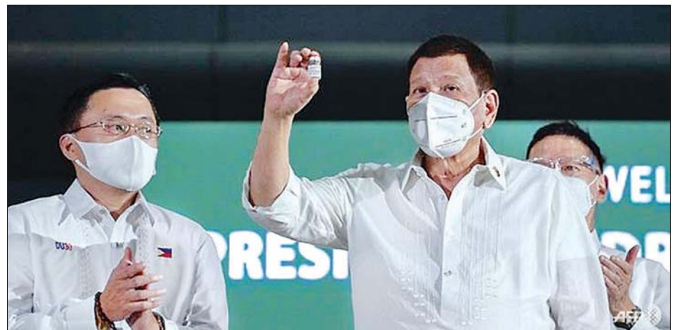
ဖိလစ်ပိုင်သမ္မတက အကဲခတ်ရန်ကိုဗစ်-၁၉ ကာကွယ်ဆေးပုလင်းကို ပြသစဉ်။

မတ်လကုန်မှစကာ လူထောင်ပေါင်းများစွာ ကိုဗစ်-၁၉ စည်းမျဉ်းစည်းကမ်းများကို ဖောက်ဖျက်ခဲ့သည့်အတွက် အပြစ်ပေးခြင်းခံခဲ့ရသည်။ ကိုဗစ်-၁၉ ကန့်သတ်တားမြစ်မှုများကို မြို့တော်မနီလာနှင့် အနီးဝန်းကျင် ပြည်နယ်များ