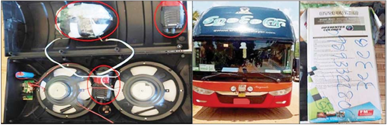
ကျိုက်ထိုမြို့၌ ရွှေစင်စင်ကြာခရီးသည်တင်ယာဉ်အတွင်းမှ ယမ်းနှင့် စကားပြောစက်နှစ်လုံး တွေ့ရှိမှု။