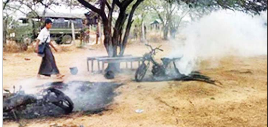
မိတ္ထီလာမြို့နယ် အမှတ်(၃၀) အခြေခံပညာမူလတန်းကျောင်း၌ ဆရာ ဆရာမများ၏ ဆိုင်ကယ်များကို ဆူပူအကြမ်းဖက်မှုများမှ မီးရှို့ဖျက်ဆီးထားသည်ကို တွေ့ရစဉ်။

ဆူပူအကြမ်းဖက်မှုများအနေဖြင့် တိုင်းဒေသကြီးအချို့ရှိ မြို့နယ်များ၌ နိုင်ငံတော်တည်ငြိမ်အေးချမ်းရေးကို ပျက်ပြားစေရန် ရည်ရွယ်ချက်၊ ပါတီနိုင်ငံရေး ကင်းရှင်းစွာဖြင့် မိမိတို့၏ တာဝန်ဝတ္တရားများအား ထမ်းဆောင်နေကြသော ဝန်ထမ်းများအပေါ် ခြိမ်းခြောက်ခြင်း စသည့် ရည်ရွယ်ချက်များဖြင့် နိုင်ငံတော်ပိုင် အဆောက်အအုံများ၊ ယာဉ်ရပ်နားစခန်းများအား မီးပုလင်းဖြင့် ပစ်ပေါက်ခြင်း၊ ဆက်သွယ်ရေး တာဝါတိုင်နှင့် ကျောင်းဆရာ/ ဆရာမများ၏ ဆိုင်ကယ်များအား မီးရှို့ဖျက်ဆီးခြင်းကဲ့သို့သော အကြမ်းဖက်မှုလုပ်ရပ်များအား လုပ်ဆောင်လျက်ရှိသည်။