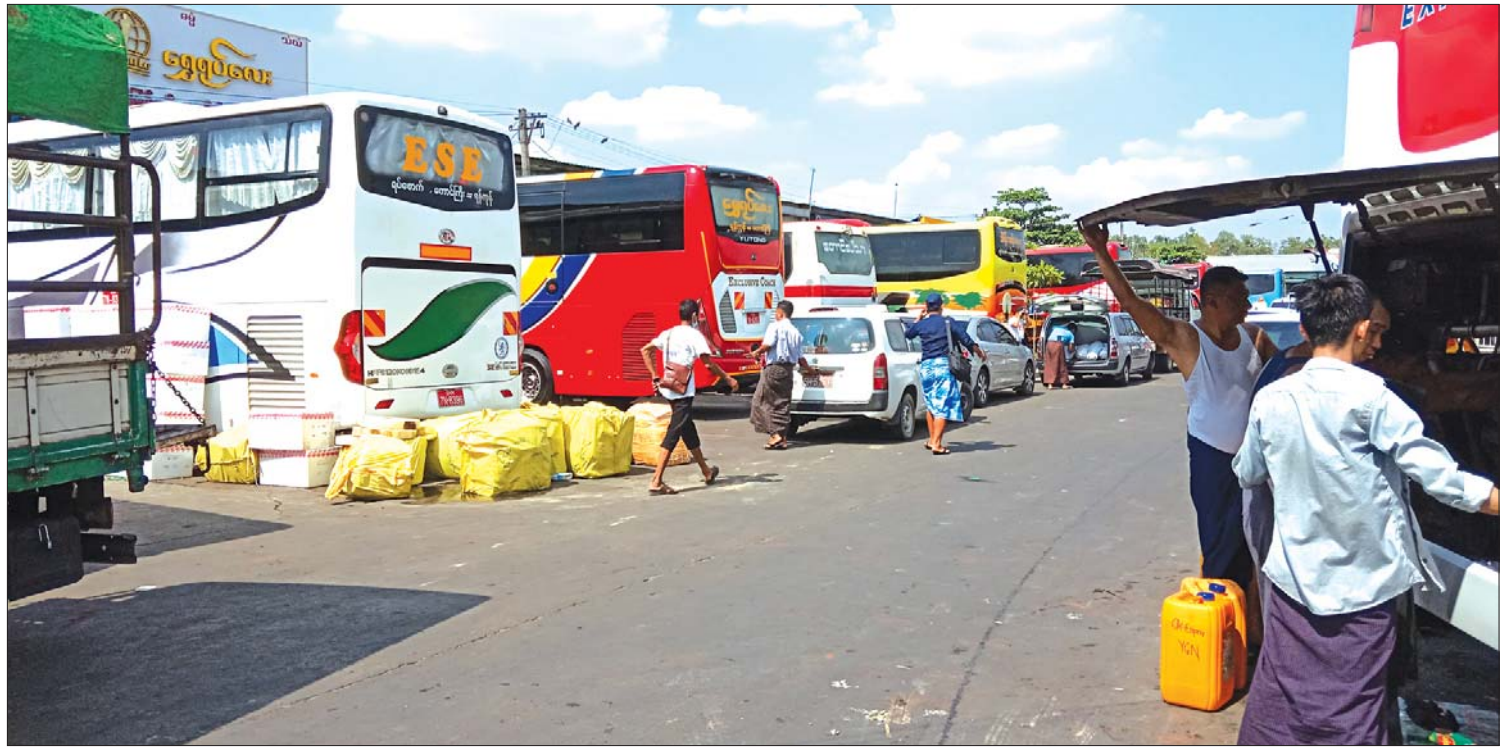
အောင်မင်္ဂလာအဝေးပြေးဝင်း၌ ခရီးသွားယာဉ်လိုင်းများမှ မော်တော်ယာဉ်များကို တွေ့ရစဉ်။