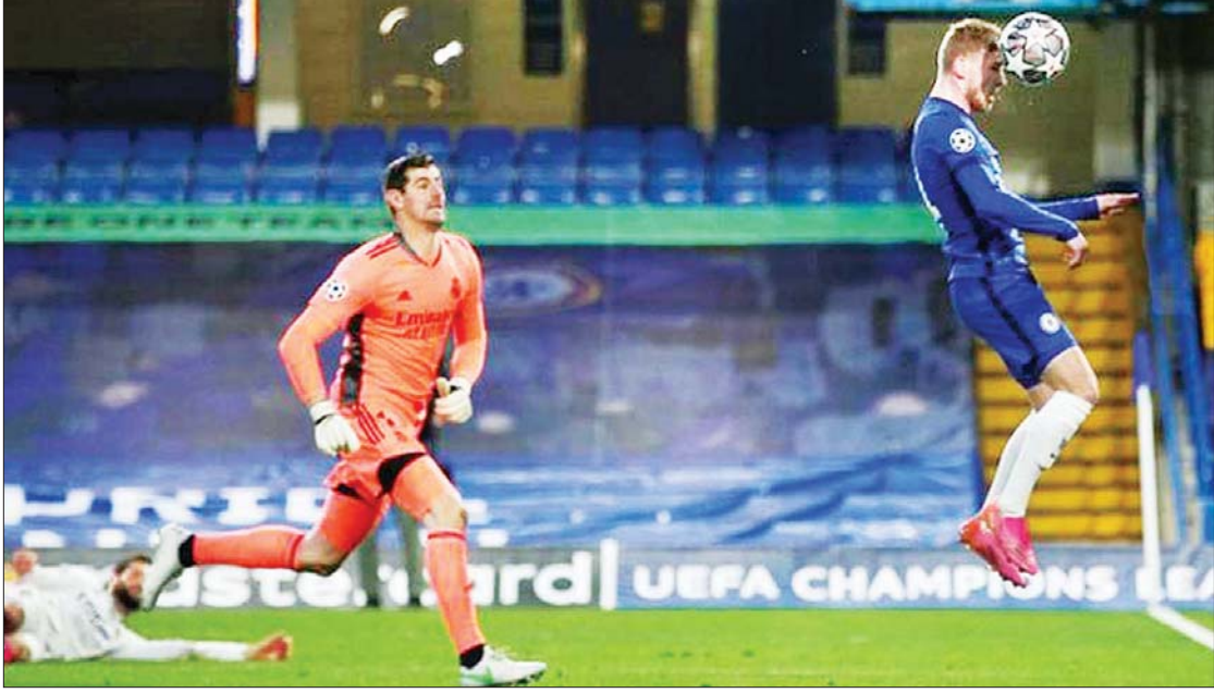
ချယ်ဆီးအသင်းမှ တီဗိုဝါနာ ရိုးရဲမက်ဒရစ်အသင်းဘက်သို့ အဖွင့်ဂိုး သွင်းယူနေစဉ်။