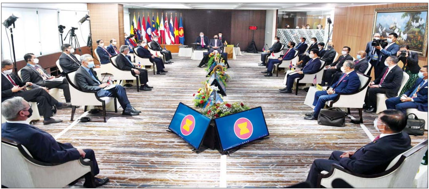
အင်ဒိုနီးရှားနိုင်ငံ ဂျကာတာမြို့၌ ဧပြီ ၂၄ ရက်က ကျင်းပသည့် အာဆီယံနိုင်ငံခေါင်းဆောင်များအစည်းအဝေး။

အာဆီယံဒေသအတွင်း ရေရှည်ကြံ့ကြံ့ခိုင်မှု ရှိပြီး စဉ်ဆက်မပြတ် ဒေသတွင်း ပြန်လည်ထူထောင် ရေးကြိုးပမ်းမှုလုပ်ငန်းစဉ်များမှာ မြန်မာနိုင်ငံအနေ နဲ့ ဆက်လက်ပံ့ပိုးသွားမယ်ဆိုတာကို နိုင်ငံတော် စီမံအုပ်ချုပ်ရေးကောင်စီဥက္ကဋ္ဌက အာဆီယံနိုင်ငံ ခေါင်းဆောင်များထံ သတင်းစကားပါးခဲ့ပါတယ်။ ဒါ့အပြင် မြန်မာနိုင်ငံအနေနဲ့ အာဆီယံရဲ့ ဦးတည် ချက်များအောင်မြင်စေဖို့၊ အာဆီယံပဋိညာဉ် စာတမ်းနဲ့ အရှေ့တောင်အာရှချစ်ကြည်ရေးနဲ့ ပူးပေါင်းဆောင်ရွက်ရေးစာချုပ် (TAC) ပါ အခြေခံ မူများနဲ့အညီ အာဆီယံ အဖွဲ့ဝင်နိုင်ငံများနှင့်အတူ နီးကပ်စွာ ပူးပေါင်းဆောင်ရွက်သွားမယ်ဆိုတာကို လည်း ထပ်လောင်း ပြောကြားနိုင်ခဲ့ပါတယ်။