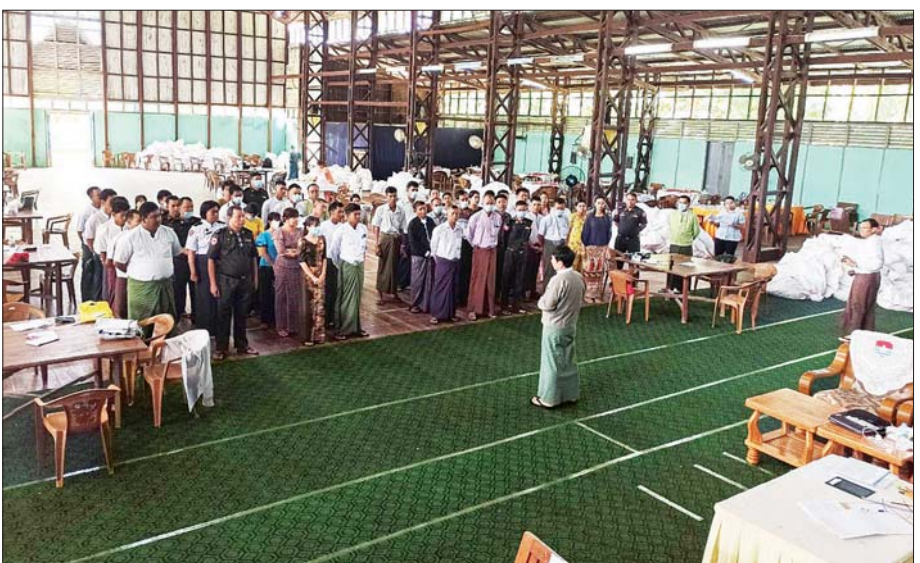
တနင်္သာရီမြို့နယ် ဆန္ဒမဲလက်မှတ် မြေပြင်စစ်ဆေးမှုမှတ်တမ်းဓာတ်ပုံ။

၁၁။ တနင်္သာရီတိုင်းဒေသကြီး၊ တနင်္သာရီမြို့နယ် ပြည်သူ့လွှတ်တော်ဆန္ဒမဲလက်မှတ်များ ရပ်ကွက်/ကျေးရွာအုပ်စုအလိုက် မြေပြင်စစ်ဆေးတွေ့ရှိချက်မှာ အောက်ပါအတိုင်းဖြစ်ပါသည်-