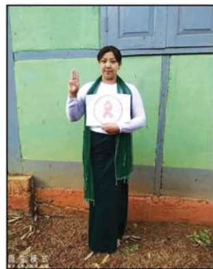
ဒေါ်အိသန္တာကို(အလယ်တန်းပြ၊ အထက(ထိသိမ်ရွေး)၊ တောင်ကြီးမြို့)မှ ဆန္ဒဖော်ထုတ်နေစဉ်