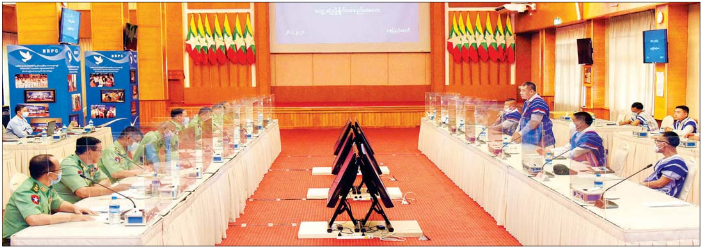
အမျိုးသားစည်းလုံးညီညွတ်ရေးနှင့် ငြိမ်းချမ်းရေးဖော်ဆောင်မှု ညှိနှိုင်းရေးကော်မတီနှင့် ဒီမိုကရေစီအကျိုးပြု ကရင်တပ်မတော်(DKBA)တို့ ဧပြီ ၂၆ ရက်က တွေ့ဆုံဆွေးနွေးစဉ်။

နိုင်ငံတော်စီမံအုပ်ချုပ်ရေးကောင်စီ ဥက္ကဋ္ဌ၊ တပ်မတော်ကာကွယ်ရေးဦးစီးချုပ်က ဧပြီ ၁၀ ရက်မှာ ဧရာဝတီတိုင်းဒေသကြီး စီမံအုပ်ချုပ်ရေးကောင်စီအဖွဲ့ဝင်များ၊ ဌာနဆိုင်ရာဝန်ထမ်းများနဲ့ တိုင်းဒေသကြီး စီမံအုပ်ချုပ်ရေးကောင်စီရုံးမှာ တွေ့ဆုံခဲ့ပါတယ်။ တိုင်းပြည်ဖွံ့ဖြိုးတိုးတက်ရေးနဲ့ ပုံမှန်အတိုင်း ပြန်လည်တည်မတ်ပေးနိုင်ရေးတို့