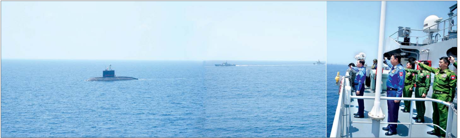
ဧပြီ ၁၀ ရက်က တပ်မတော်(ကြည်း၊ ရေ၊ လေ) လေ့ကျင့်ခန်းများ ဆောင်ရွက်ရာ နိုင်ငံတော်စီမံအုပ်ချုပ်ရေးကောင်စီဥက္ကဋ္ဌ၊ တပ်မတော်ကာကွယ်ရေးဦးစီးချုပ် ဗိုလ်ချုပ်မှူးကြီးမင်းအောင်လှိုင်အား လေ့ကျင့်ခန်းတွင် ပါဝင်သည့် ရေငုပ်သင်္ဘောစစ်ရေယာဉ် (မင်းရဲ သိင်္ခံသူ)၊ စစ်ရေယာဉ်များက SINGLE LINE FORMATION ဖြင့် ပုံပြုချိတ်ကာ ချိတ်ကတ်ခတ်မောင်း အလေးပြုကြစဉ်။