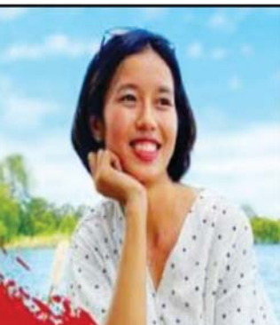
ဒေါက်တာ အိမ်မုန့်ကို