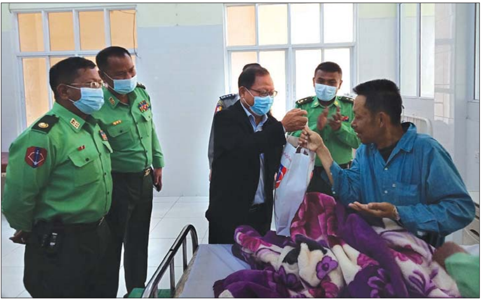
များအား အားပေးစကားပြောကြားပြီး စားသောက် ကုန်များ ထောက်ပံ့ပေးအပ်ကြောင်း သိရသည်။ ပြည်နယ် (ပြန်/ဆက်)

ယင်းနောက် ပြည်နယ်စီမံအုပ်ချုပ်ရေးကောင်စီ ဥက္ကဋ္ဌ၊ ဒုတိယတိုင်းမှူးနှင့် ပြည်နယ်ကောင်စီ အဖွဲ့ဝင်များသည် ဆေးရုံတက်ရောက်သည့် လူနာ