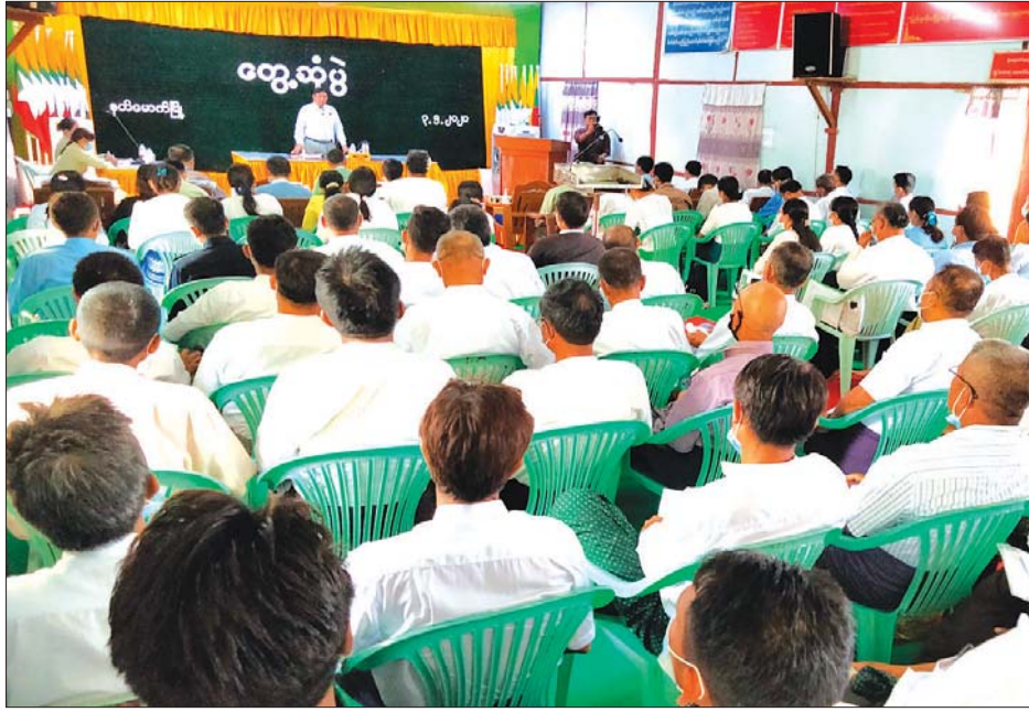
လုပ်ငန်းကို ကြည့်ရှုစစ်ဆေးပြီး လိုအပ်သည်များ ဆက်လက်၍ နတ်မောက်မြို့နယ် အထွေ ထွေအုပ်ချုပ်ရေးဦးစီးဌာန အစည်းအဝေး ညွှန်ကြားသည်။

ထို့နောက် ပင်းဗောဓိရွှေညောင်တော်သို့ ဝင်ရောက်ဖူးမြော်ပြီး ပင်း အ.ထ.က ကျောင်း သန့်ရှင်းရေးနှင့် ကျောင်းဖွင့်လှစ်နိုင်ရေး ကြိုတင် ပြင်ဆင်ထားမှုကို ကြည့်ရှုစစ်ဆေးသည်။ ထို့ပြင် ကျေးလက်လမ်း ဖွံ့ဖြိုးရေးဦးစီးဌာနမှ ဆောင်ရွက်နေ သည့် (ရွာမွန် - ဇီးဖြူကုန်း- ကျောက်ပန်းတောင်း လမ်း- တောင်ထောင့်- ကုန်းစောင်းလမ်း)မြေသား တာပေါင်တင် ဂျင်း/ကျောက်ရော မြေခင်းခြင်း