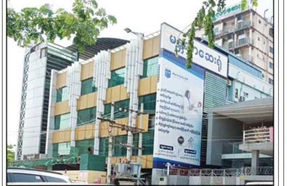
ဒေါက်တာ အိမ်မုန့်ကို (အထူးကု၊ ပုသိမ်ကြီးပြည်သူ့ဆေးရုံ)အား ဆေးကုသခွင့်ပေးထားသည့် “မန္တလာ”ဆေးရုံမှတ်တမ်းဓာတ်ပုံ