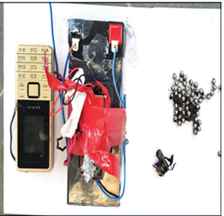
လက်လုပ်ပုံတစ်လုံး ပေါက်ကွဲမှု။