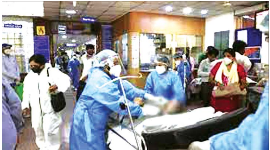
အိန္ဒိယနိုင်ငံ ဆေးရုံတစ်ရုံသို့ ကိုဗစ်-၁၉ လူနာတစ်ဦး တင်ဆောင်လာသည်ကို တွေ့ရစဉ်။

ဧပြီလလယ်ကတည်းက ပြည်နယ်အများအပြားတွင် အမျိုးမျိုးသောလူမှုရေးဆိုင်ရာ ကန့်သတ်ချက်များ ချမှတ်လုပ်ဆောင်ခဲ့သော်လည်း ကိုဗစ်-၁၉ ကူးစက်ဖြစ်ပွားမှုမှာ အရှိန်အဟုန်မပျက် ဆက်လက်ဖြစ်ပွားလျက်ရှိသည်။ ကျွမ်းကျင်သူများက အမျိုးသားအဆင့်ကန့်သတ်ပိတ်ဆို့မှုကို ကျင့်သုံးရန် တိုက်တွန်းပြောကြားလိုက်သည်။ အင်န်အိတ်ချ်က