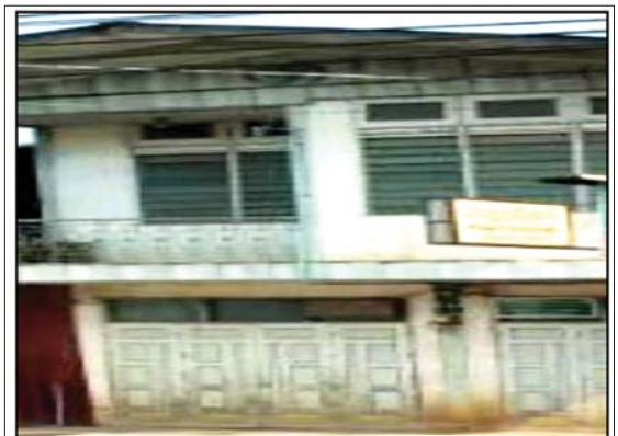
ဒေါက်တာ ဇင်မာလတ် (လ/ထဆရာဝန်၊ မိုးကုတ်ပြည်သူ့ဆေးရုံ) ဆေးကုသနေသည့် အမည်မရှိဆေးခန်းမှတ်တမ်းဓာတ်ပုံ