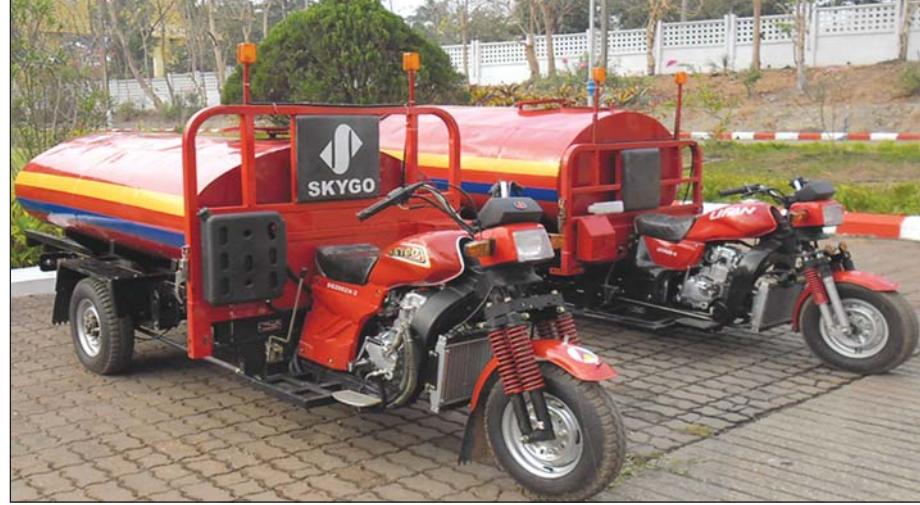
ကျေးရွာများတွင်ထားရှိသင့်သည့် အပျော်စားမီးသတ်ယာဉ်များ။

မီးဘေးအန္တရာယ်၊ အခြား သဘာဝဘေးအန္တရာယ်၊ ကပ်ရောဂါဘေးအန္တရာယ် သို့မဟုတ် ရုတ်တရက်ဖြစ်ပွားသော ဘေးအန္တရာယ်တစ်မျိုးမျိုး ကျရောက်သည့်အခါ မီးငြိမ်းသတ်ရေး၊ ကာကွယ်တားဆီးရေး၊ ရှာဖွေကယ်ဆယ်ရေးတို့ကို ဆောင်ရွက်ရန်နှင့် ဘေးအန္တရာယ်တစ်မျိုးမျိုး ကျရောက်သည့်အခါ ပြည်သူတို့၏ပူးပေါင်းဆောင်ရွက်မှု ရရှိစေရန် ပညာပေး စည်းရုံးလှုံ့ဆော်မှုများ ကျယ်ကျယ်ပြန့်ပြန့် ဆောင်ရွက်လျက်ရှိကြောင်း တွေ့မြင်