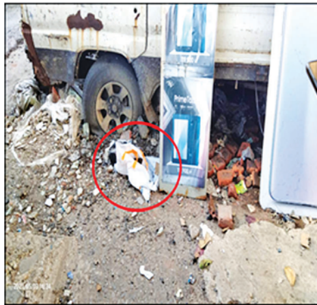
လသာမြို့နယ်၌ လက်လုပ်ပုံတစ်လုံး ပေါက်ကွဲမှု။

တရားမဝင်အဖွဲ့အစည်းအဖြစ် ကြေညာထားသော NUG အဖွဲ့အနေဖြင့် နိုင်ငံတစ်ဝန်း ဆူပူအကြမ်းဖက်မှုများလုပ်ဆောင်ရန် ကြေညာချက်များ ထုတ်ပြန်ခြင်း၊ တိုက်တွန်းခြင်းများ ဆောင်ရွက်လျက်ရှိပြီး ယခုကဲ့သို့ အကြမ်းဖက်ဖြစ်စဉ်များ ဖြစ်ပွားအောင် ဆောင်ရွက်လျက်ရှိသဖြင့် အပြစ်ပွဲပြည်သူများအနေဖြင့် ထိတ်လန့်ကြောက်ရွံ့ စိုးရိမ်ပူပန်ခြင်းများ ဖြစ်ပေါ်လျက်ရှိသည်။ လုံခြုံရေးတပ်ဖွဲ့ဝင်များအနေဖြင့် အကြမ်းဖက်လုပ်ရပ်များ လုပ်ဆောင်နေသူများအား ပြည်သူများနှင့်အတူ ပူးပေါင်း၍ ဖမ်းဆီးရမိရေးနှင့် တရားဥပဒေအရ ထိရောက်စွာအရေးယူနိုင်ရေး ဆက်လက်ဆောင်ရွက်လျက်ရှိကြောင်း သတင်းရရှိသည်။