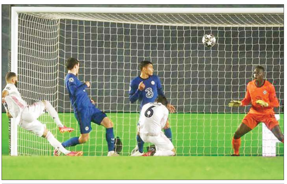
ရီးရဲမက်ဒရစ်အသင်းနှင့် ချယ်ဆီးအသင်းတို့ ပထမအကျော့ပွဲစဉ် ယှဉ်ပြိုင်ကစားစဉ်။

အဆိုပါ နှစ်သင်းယှဉ်ပြိုင် ကစားခဲ့သည့် ပထမအကျော့