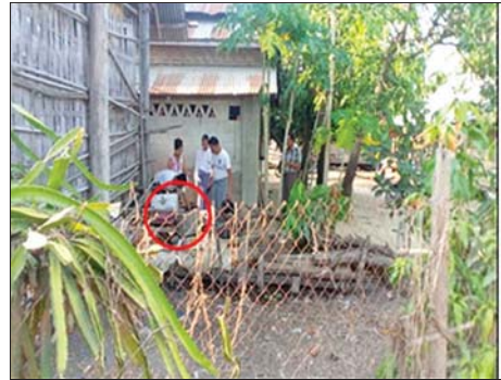
လယ်ဝေးမြို့နယ်၌ ဒုတိယပညာရေးမှူးနေအိမ်အား မီးပုလင်းဖြင့် ပစ်ခတ်မှု။

အထက်ပါ ဖြစ်စဉ်များမှ အကြမ်းဖက်မှု လုပ်ရပ်များကို ကျူးလွန်သူများအား ဥပဒေနှင့်အညီ ထိရောက်စွာအရေးယူနိုင်ရေး လုံခြုံရေးတပ်ဖွဲ့ဝင်များက စုံစမ်းဖော်ထုတ်လျက်ရှိကြောင်း သိရသည်။