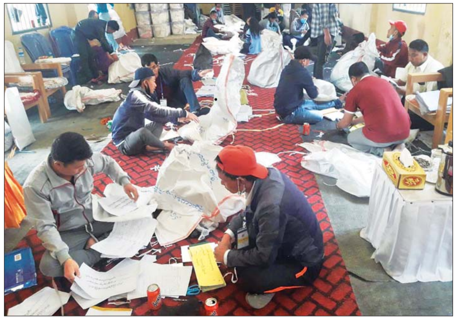
တွန်းဇံမြို့နယ် ဆန္ဒမဲလက်မှတ်မြေပြင်စစ်ဆေးမှုမှတ်တမ်း။

၁၁။ တွန်းဇံမြို့နယ်တွင် ရပ်ကွက် ၄ ရပ်ကွက်၊ ကျေးရွာအုပ်စု ၃၁ အုပ်စု၊ မဲရုံအရေအတွက် ၈၃ ရုံတို့တွင် မဲရုံများအလိုက် မဲလက်မှတ်အပိုများနှင့် ပျောက်ဆုံးနေမှုများ တွေ့ရှိရပြီး ရပ်ကွက်/ ကျေးရွာအုပ်စုအလိုက် ၅၀၅ စောင် ပျောက်ဆုံးနေပြီး ၈၇ စောင် ပိုသုံးထားကြောင်း တွေ့ရှိရသည်။ မြို့နယ်ကြိုတင်မဲလက်မှတ်တွင် ထုတ်ယူရရှိခဲ့သော ဆန္ဒမဲလက်မှတ်မှာ ၄၁ စောင်၊ မဲပေးအသုံးပြုခဲ့သော လက်မှတ်ဖြတ်ပိုင်းများမှာ ၁၃ စောင်ဖြစ်ပြီး ကျန်ရှိရမည့် မဲလက်မှတ်အရေအတွက်မှာ ၂၈ စောင်ဖြစ်သော်လည်း မြေပြင်လက်ကျန်တွင် ၂၁ စောင်သာ တွေ့ရှိရသောကြောင့် ၇ စောင် ပျောက်ဆုံးနေကြောင်း တွေ့ရှိရသည်။ မြို့နယ်ရွေးကောက်ပွဲကော်မရှင်အဖွဲ့တွင် ကျန်ရှိရမည့် လက်ကျန်အရေအတွက် ၁၁၀၀ ဖြစ်ပြီး မြေပြင်စစ်ဆေးချက်တွင် ၁၁၀၀ ကျန်ရှိနေသောကြောင့် ကိုက်ညီမှုရှိကြောင်း တွေ့ရှိရသည်။