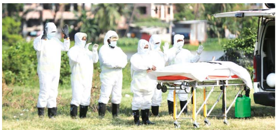
ဘင်္ဂလားဒေ့ရှ်နိုင်ငံ ဒါကာမြို့တွင် ကိုဗစ်-၁၉ ဖြင့် ကွယ်လွန်သွားသူကို သင်္ဂြိုဟ်ရန်ပြင်ဆင်နေစဉ်။

ဘင်္ဂလားဒေ့ရှ်နိုင်ငံတစ်ဝန်း မေ ၃ ရက်အတွင်း နမူနာပေါင်း ၂၁၉၈၄ ခုကို စမ်းသပ်စစ်ဆေးခဲ့ကြောင်း တရားဝင်အချက်အလက်များက ဖော်ပြသည်။