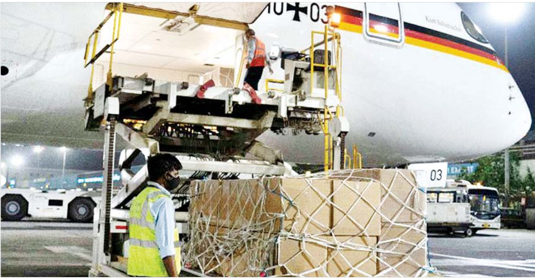
ဂျာမနီနိုင်ငံက ပေးပို့လိုက်သည့် ဆေးဘက်အထောက်အကူပြုပစ္စည်းများ နယူးဒေလီလေဆိပ်သို့ ရောက်ရှိလာသည်ကို တွေ့ရစဉ်။

ကာကွယ်ဆေးမလုံလောက်မှု ရင်ဆိုင်နေရ အိန္ဒိယနိုင်ငံအတွင်း ထုတ်လုပ်သည့် ကိုဗစ်-၁၉ ကာကွယ်ဆေးကို ပြည်ပတင်ပို့ခြင်း ရပ်ဆိုင်းထားပြီး ပြည်တွင်း၌ ကာကွယ်ဆေးထိုးပေးနိုင်ရေး လုပ်ဆောင်နေသော်လည်း ပြည်နယ်အများစုတွင် ကာကွယ်ဆေး မလုံလောက်မှုနှင့် ရင်ဆိုင်နေရသည်။ ကာကွယ်ဆေးထိုးပေးသည့် စင်တာများ၏ ရှေ့တွင် လူတန်းရှည်ကြီးဖြစ်သည်အထိ တန်းစီစောင့်ဆိုင်းနေသည်ကိုလည်း တွေ့မြင်