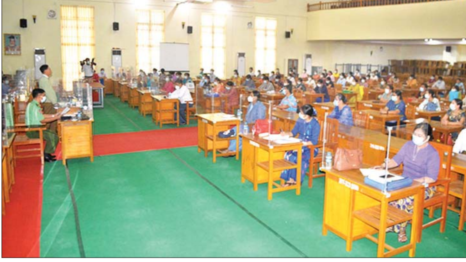
တက္ကသိုလ်အသီးသီးရှိ ပါမောက္ခချုပ်များနှင့် ဒုတိယပါမောက္ခချုပ်များက မေ ၅ ရက်တွင် ကျောင်းများ ပြန်လည်ဖွင့်လှစ်သင်ကြားမည့် အခြေအနေများနှင့် ပတ်သက်၍ ရှင်းလင်းတင်ပြရာ တိုင်းဒေသကြီး စီမံအုပ်ချုပ်ရေးကောင်စီဥက္ကဋ္ဌနှင့် တိုင်းမှူးတို့က နောက်ဆုံးစာသင်နှစ်သို့ တက်ရောက်ကြမည့် ကျောင်းသားကျောင်းသူများ စာသင်ကြားချိန်တွင် စိတ်အေးချမ်းသာစွာ ပညာသင်ကြားနိုင်ရေးနှင့် နေထိုင်ရေး၊ သွားလာရေး၊ စားသောက်ရေးနှင့် လုံခြုံရေးဆိုင်ရာ ကိစ္စရပ်များကို ညှိနှိုင်းဆောင်ရွက်ပေးခဲ့ကြောင်း သတင်းရရှိသည်။ သတင်းစဉ်

နေပြည်တော် မေ ၄ စစ်ကိုင်းတိုင်းဒေသကြီး မုံရွာမြို့ရှိ မုံရွာတက္ကသိုလ်၊ မုံရွာစီးပွားရေးတက္ကသိုလ်နှင့် မုံရွာနည်းပညာတက္ကသိုလ်များသို့ မေ ၃ ရက် မွန်းလွဲပိုင်းတွင် စစ်ကိုင်းတိုင်းဒေသကြီး စီမံအုပ်ချုပ်ရေးကောင်စီဥက္ကဋ္ဌ ဦးမောင်မောင်လင်း၊ အနောက်မြောက်တိုင်းစစ်ဌာနချုပ် တိုင်းမှူး ဗိုလ်မှူးချုပ် ဖြိုးသန့်နှင့် အဖွဲ့ဝင်များ သွားရောက်၍ မေ ၅ ရက်မှစကာ တက္ကသိုလ်များ၏ နောက်ဆုံး စာသင်နှစ်များ ပြန်လည်ဖွင့်လှစ်သင်ကြားမည့် အခြေအနေများနှင့် ပတ်သက်၍ တက္ကသိုလ်ရှိ ပါမောက္ခချုပ်များ၊ ဆရာ ဆရာမများနှင့် တွေ့ဆုံဆွေးနွေးသည်။ (အပေါ်ယာပုံ) ထိုသို့တွေ့ဆုံဆွေးနွေးရာတွင်