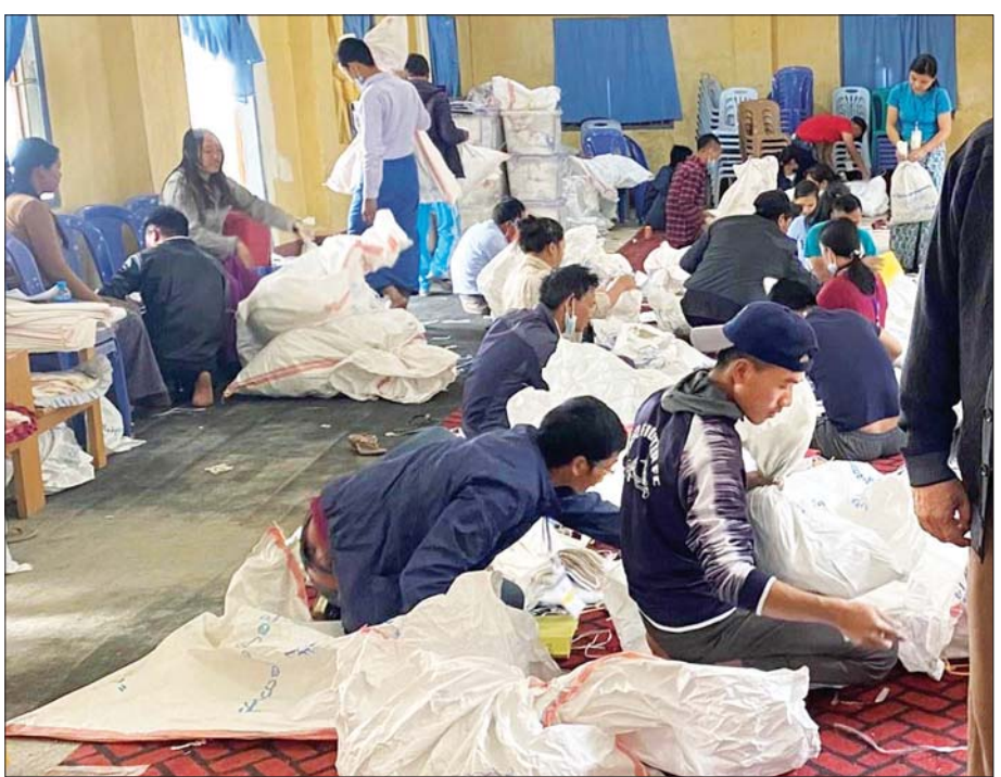
တီးတိန်မြို့နယ် ဆန္ဒမဲလက်မှတ်မြေပြင်စစ်ဆေးမှုမှတ်တမ်း။