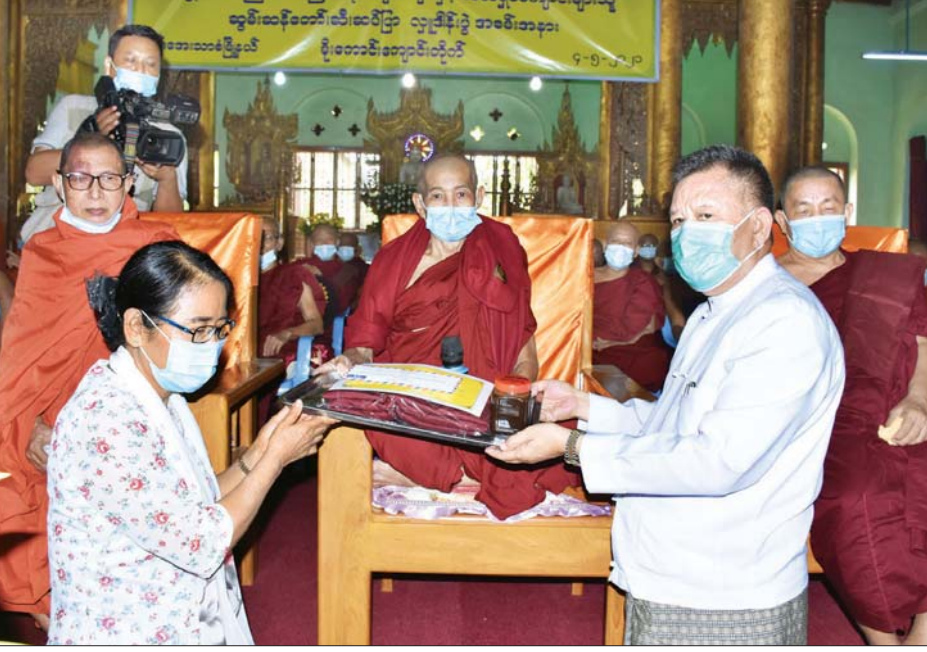
အတွင်းရှိ ဘုန်းတော်ကြီးသင်ပညာရေးကျောင်း သီလရှင်ကျောင်း ၈၄ ကျောင်းကို ဆန် အိတ် ၅၇၀၊ ဆီ ၂၇၂၆ ပိဿာနှင့် ဆပ်ပြာခဲ ၂၇၂၆၀ လှူဒါန်းပြီးဖြစ်ကြောင်းနှင့် ကျန်မြို့နယ်များအတွင်းရှိ ဘုန်းတော်ကြီးသင်ပညာရေးကျောင်းနှင့် သီလရှင်ကျောင်းများသို့လည်း ဆက်လက်လှူဒါန်းသွားမည် ဖြစ်ကြောင်း သတင်းရရှိသည်။ သတင်းစဉ်

သက်ဆိုင်ရာတာဝန်ရှိသူများက တိုင်းဒေသကြီး သံဃနာယကအဖွဲ့၊ အကျိုးတော်ဆောင် ဦးဆရာတော်ထံမှ ငါးပါးသီလ ခံယူဆောင်တည်ကြသည်။ ယင်းနောက် တိုင်းဒေသကြီး စီမံအုပ်ချုပ်ရေးကောင်စီဥက္ကဋ္ဌက သာသနာရေးဆိုင်ရာများကို ဆရာတော်ကြီးများထံ လျှောက်ထားပြီး နိုင်ငံတော် ဗဟိုသံဃာ့ဝန်ဆောင် ဘဒ္ဒန္တဇောတိက ဝေယံဘုံသာတိုက်ဆရာတော်ထံမှ ဩဝါဒကာတာကို နာယူကြည့်လိုကြသည်။ ဆက်လက်၍ တိုင်းဒေသကြီး စီမံအုပ်ချုပ်ရေးကောင်စီဥက္ကဋ္ဌနှင့် ဇနီးတို့က မန္တလေးတိုင်းဒေသကြီး စီမံအုပ်ချုပ်ရေးကောင်စီနှင့် အလယ်ပိုင်းတိုင်းစစ်ဌာနချုပ်တို့မှ လှူဒါန်းသည့် ဆန်၊ ဆီ၊ ဆပ်ပြာများကိုလည်းကောင်း၊ မိသားစုအလှူအဖြစ် သင်္ကန်း၊ ဝတ္ထုငွေလှူဖွယ်ပစ္စည်းများကို လည်းကောင်း ဆက်ကပ်လှူဒါန်းကြပြီး(ယာပုံ) တိုင်းဒေသကြီး စီမံအုပ်ချုပ်ရေးကောင်စီဥက္ကဋ္ဌနှင့် ဇနီး၊ အဖွဲ့ဝင်များနှင့် တက်ရောက်လာသူများက အနုမောဒနာ ရေစက်ချတရားနာယူကြည့်လိုကာ လှူဒါန်းမှုအစုစုတို့အတွက် ရေစက်သွန်းချ အမျှပေးဝေကြသည်။ ယနေ့လှူဒါန်းမှုတွင် ချမ်းအေးသာစံမြို့နယ်