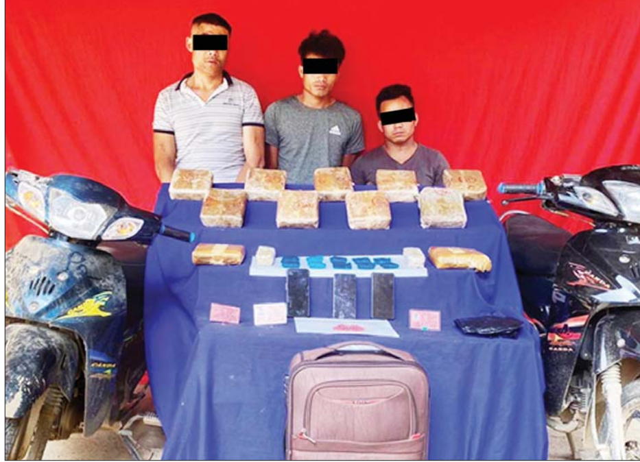
သိမ်းဆည်းရမိသည့် စိတ်ကြွရူးသွပ်ဆေးပြားများနှင့်အတူ တွေ့ရစဉ်။

နေပြည်တော် မေ ၄ နိုင်ငံရဲတပ်ဖွဲ့မှ သိရသည်။ ညနေပိုင်းတွင် ဖားကန့်မြို့နယ် အိုင်ဆွေမြင့် (၂၆)နှစ်တို့ သုံးဦး အား မော်တော်ဆိုင်ကယ် နှစ်စီး ဖြင့် သယ်ဆောင်လာသည့် ဒေသကာလတန်ဖိုး ငွေကျပ် ၁၀၄၆ သိန်း ကျော် တန်ဖိုးရှိ စိတ်ကြွ ရူးသွပ်ဆေးပြား မြစ် ၆၉၅၅၀ သိမ်းဆည်းရမိခဲ့ကြောင်း၊ စစ်ဆေး ပေါ်ပေါက်ချက်များအရ သိမ်းဆည်းရမိသော စိတ်ကြွ ရူးသွပ်ဆေးပြားများကို ရှမ်းပြည် နယ်(မြောက်ပိုင်း) ကွတ်ခိုင် မြို့နယ်မှ ကချင်ပြည်နယ် ဖားကန့်မြို့နယ်သို့ သယ်ဆောင် ရောင်းဝယ်ခြင်းဖြစ်ကြောင်း သိရ သဖြင့် ၎င်းတို့အား မူးယစ် ဆေးဝါးနှင့် စိတ်ကို ပြောင်းလဲစေ သော ဆေးဝါးများ ဆိုင်ရာဥပဒေ အရ အရေးယူထားရှိပြီး ကွင်းဆက်ပြစ်မှု ကျူးလွန်သူ များကို စစ်ဆေး ဖော်ထုတ်လျက် ရှိကြောင်း သိရသည်။