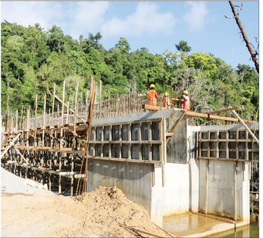
ပြည်ထောင်စုဝန်ကြီး ဒုတိယဗိုလ်ချုပ်ကြီး ထွန်းထွန်းနောင် ကွန်ကရစ်တံတားတည်ဆောက်နေမှုကို ကြည့်ရှုစစ်ဆေးစဉ်။