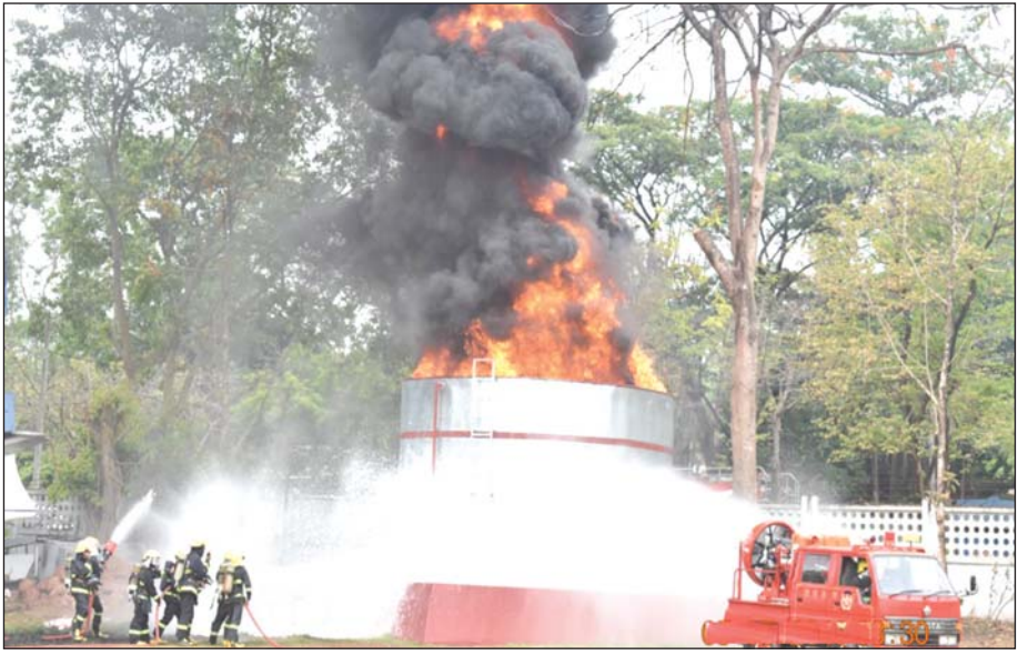
ပိုလန်နိုင်ငံထုတ် LUF 60 ဖြင့် မီးငြိမ်းသတ်ရေးစွမ်းရည် သရုပ်ပြသစဉ်။

နှစ်သက်တမ်းအားဖြင့် ၇၅ နှစ်ဟု ဆိုသော်လည်း သမိုင်းမှတ်တမ်းများအရ ခရစ်သက္ကရာဇ် အေဒီ ၁၀၄၄ - ၁၀၇၇ ခုနှစ်(မြန်မာသက္ကရာဇ် ၄၀၆ ခုနှစ်မှ ၄၃၉ ခုနှစ်အထိ) ပုဂံထီးနန်းကို စိုးစံခဲ့သော အနော်ရထာမင်းကြီးလက်ထက်တွင် “သောသော ညံ ပုဂံမီးဆော်မောင်း” ဆိုသည့် ဂဏန်း အမှတ်အသား သံခိပ်(လင်္ကာ)အရ တစ်နည်းအားဖြင့် နေ့နံသင့် သင်္ချာနည်းအရ ရှေးခေတ်အခေါ် မီးကပ်သား ဖြစ်ခဲ့ပြီး ဖွဲ့စည်းခဲ့သည်မှာ နှစ်ပေါင်း ၉၇၆ နှစ်၊ ယေဘုယျအားဖြင့် နှစ်ပေါင်း ၁၀၀၀ နီးပါးခန့် ရှိခဲ့ပြီဖြစ်သည်။ ထို့ကြောင့်ပင် ကမ္ဘာ့မီးသတ်တပ်ဖွဲ့များ စတင်ပေါ်ပေါက်ခဲ့သည့် သမိုင်းမှတ်တမ်းများနှင့် နှိုင်းယှဉ်ပါက ရှေးအကျဆုံးသော မီးသတ်တပ်ဖွဲ့အဖြစ် ဖွဲ့စည်းဆောင်ရွက်ခဲ့သည်ဟု ဆိုရမည်ဖြစ်သည်။