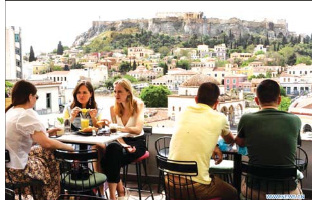
ဂရိနိုင်ငံ အေသင်မြို့ရှိ စားသောက်ဆိုင်တွင် စားသောက်နေသည့် ဧည့်သည်များကို တွေ့ရစဉ်။