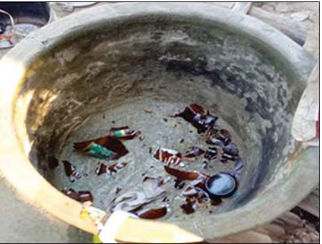
ရဲပြန်ကြား