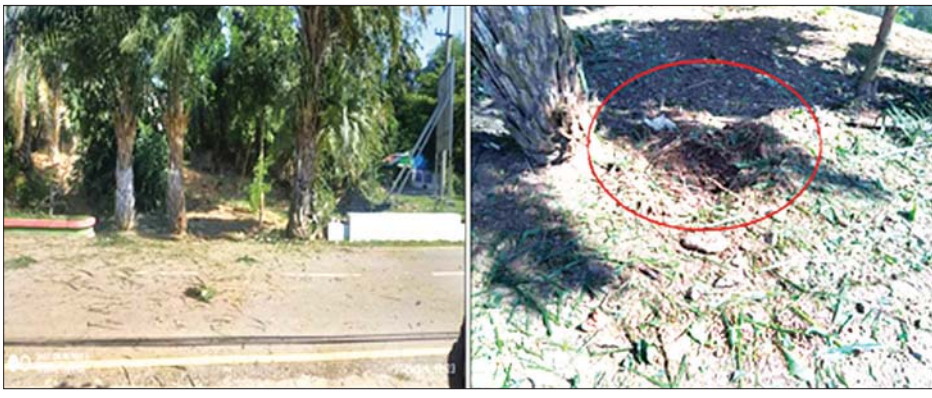
သထုံမြို့၌ ချိန်ကိုက်မိုင်း တစ်လုံးပေါက်ကွဲမှုဖြစ်ပွားသည်ကို တွေ့ရစဉ်။

ထိုသို့လုပ်ဆောင်လျက်ရှိရာ မေ ၁ ရက် မွန်းလွဲ ၂ နာရီ ၅၅ မိနစ်တွင် မွန်ပြည်နယ် သထုံမြို့နယ်ခရိုင်ရပ်ကွက် ရုံးကြီးလမ်း၌ မိုင်းတစ်လုံးပေါက်ကွဲခဲ့ပြီး အဆိုပါပေါက်ကွဲမှုကြောင့် လမ်းမကြီးပေါ်မှ ဆိုင်ကယ်စီးနင်းလာသူ အမျိုးသမီးသုံးဦးတွင် ထိခိုက်ဒဏ်ရာများရရှိခဲ့သဖြင့် သထုံမြို့ပြည်သူ့ဆေးရုံသို့ ပို့ဆောင်ဆေးကုသမှုခံယူလျက်ရှိသည်။