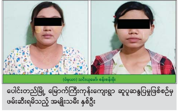
(ဝိမ္မသာ) သင်းယုမော် နှစ်ဦး ပေါင်းတည်မြို့ မြောက်ကြီးကုန်းကျေးရွာ ဆူပူဆန္ဒပြမှုဖြစ်စဉ်မှ ဖမ်းဆီးရမိသည့် အမျိုးသမီး နှစ်ဦး

အထက်ပါဖြစ်စဉ်တွင် ဖမ်းဆီးရမိသူများအား ဥပဒေနှင့်အညီ အရေးယူဆောင်ရွက်သွားမည်ဖြစ်ကြောင်း သတင်းရရှိသည်။ သတင်းစဉ်