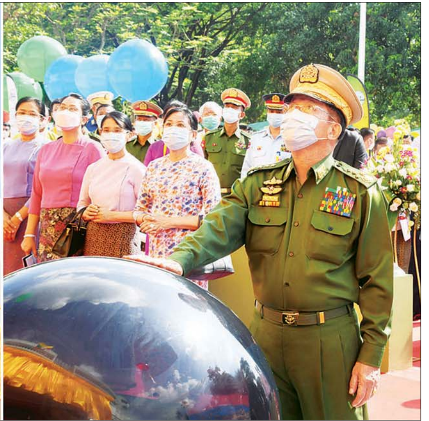
နိုင်ငံတော်စီမံအုပ်ချုပ်ရေးကောင်စီဥက္ကဋ္ဌ တပ်မတော်ကာကွယ်ရေးဦးစီးချုပ် ဗိုလ်ချုပ်မှူးကြီး မင်းအောင်လှိုင် မြဝတီမီဒီယာစင်တာကို စက်ခလုတ်နှိပ်ဖွင့်လှစ်ပေးစဉ်။