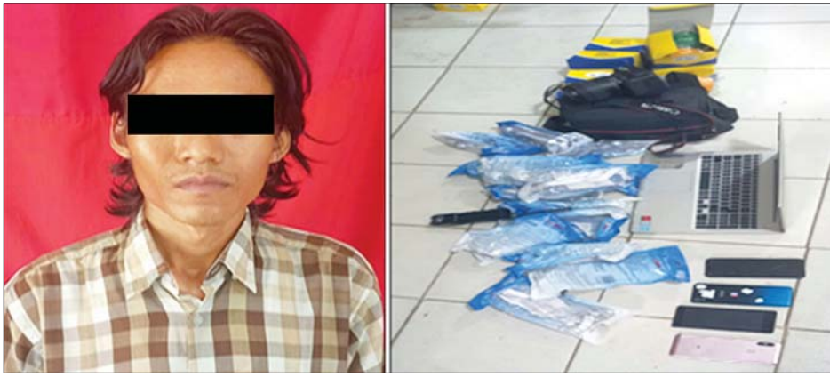
ဒဂုံမြို့သစ်(အရှေ့ပိုင်း)မြို့နယ်၌ ဆူပူအကြမ်းဖက်ဆန္ဒပြရာတွင်ပါဝင်သူ အမျိုးသားတစ်ဦးအား ဖမ်းဆီးရမိခဲ့သည်။