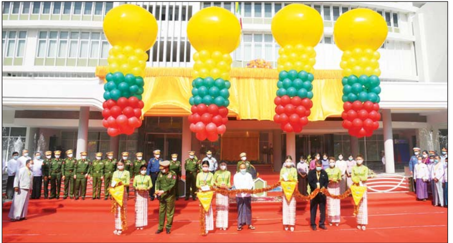
ပြည်ထောင်စုဝန်ကြီး ဦးချစ်နိုင်၊ ရန်ကုန်မြို့တော် စည်ပင်သာယာရေးကော်မတီဥက္ကဋ္ဌ မြို့တော်ဝန် ဦးစိုလ်ဌေးနှင့် မြန်မာစီးပွားရေးကော်ပိုရေးရှင်းဥက္ကဋ္ဌ ဒုတိယဗိုလ်ချုပ်ကြီး ညိုစောတို့ မြဝတီမီဒီယာ စင်တာကို ဖဲကြိုဖြတ်ဖွင့်လှစ်ပေးစဉ်။