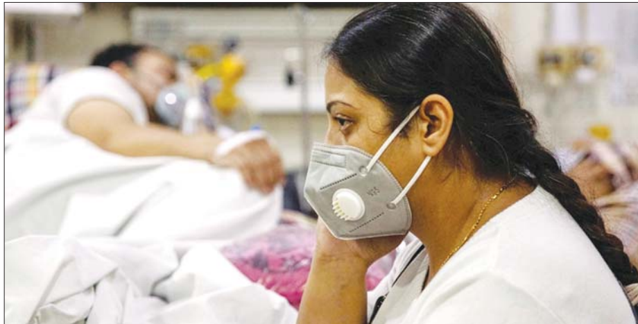
အိန္ဒိယနိုင်ငံရှိ ဆေးရုံတစ်ရုံတွင် အထူးကြပ်မတ်ကုသဆောင်၌ ကုသမှုခံယူနေသည့် လူနာတစ်ဦးကို တွေ့ရစဉ်။ လျက်ရှိသည်။ ကာကွယ်ဆေးနှင့် ပတ်သက်သည့် မျှော်လင့်ထားသည်။ ပစ္စည်းများလည်း အမေရိကန်မှ ပေးပို့မည်ဟု အင်န်အိတ်ချ်ကေ

ကာကွယ်ဆေးထောက်ပံ့ပေးနိုင်မှုပြတ်တောက်နေသည့်အတွက် အချို့သော ပြည်နယ်များတွင် နောက်ထပ် အသက်အုပ်စုများကို ကိုဗစ်-၁၉ ကာကွယ်ဆေးထိုးပေးရန် လုံလောက်မှုမရှိ ဖြစ်နေရသည်။ အိန္ဒိယအစိုးရသည် ရုရှားနိုင်ငံထုတ် ကိုဗစ်-၁၉ ကာကွယ်ဆေးကို အရေးပေါ်အခြေအနေ သုံးစွဲခွင့်အတွက် ခွင့်ပြုပေးပြီး အသုံးပြုနိုင်ရေးစီစဉ်