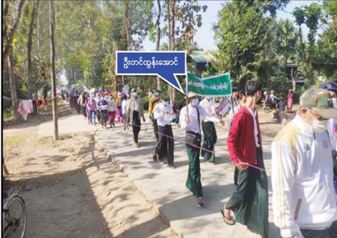
ဦးတင်ထွန်းအောင်(ကျောင်းအုပ်၊ အမက-မိဿလင်၊ ရေကြည်မြို့နယ်)မှ ဦးဆောင်၍ ဆန္ဒဖော်ထုတ်နေစဉ်