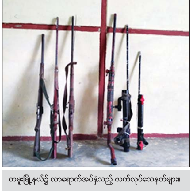
တမူးမြို့နယ်၌ လာရောက်အပ်နှံသည့် လက်လုပ်သေနတ်များ။

လူထုမှ လာရောက်အပ်နှံသော လက်လုပ် သေနတ်များအား လုံခြုံရေးတပ်ဖွဲ့ဝင်များက လက်ခံ ရယူခဲ့ပြီး စနစ်တကျ သိမ်းဆည်း ထားရှိကြောင်း သတင်းရရှိ သည်။ သတင်းစဉ်