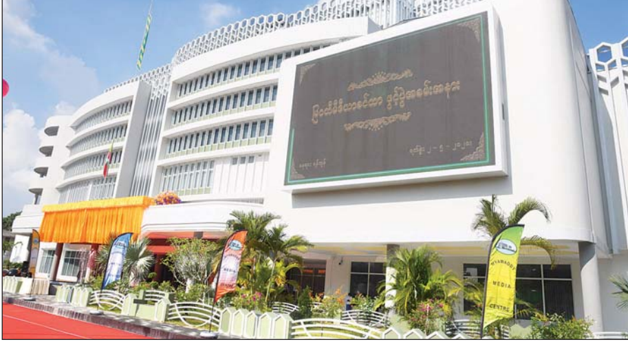
မြဝတီမီဒီယာစင်တာအဆောက်အအုံကို တွေ့ရစဉ်။