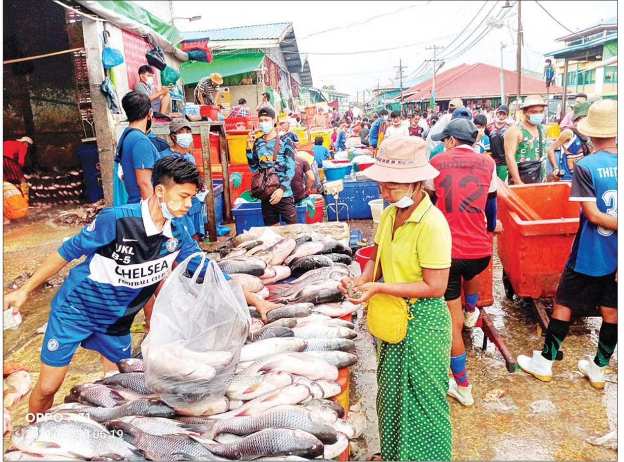
ဗဟိုစံပြငါးဈေးအတွင်း ဈေးရောင်း၊ ဈေးဝယ်များဖြင့် စည်ကားနေသည်ကို တွေ့ရစဉ်။