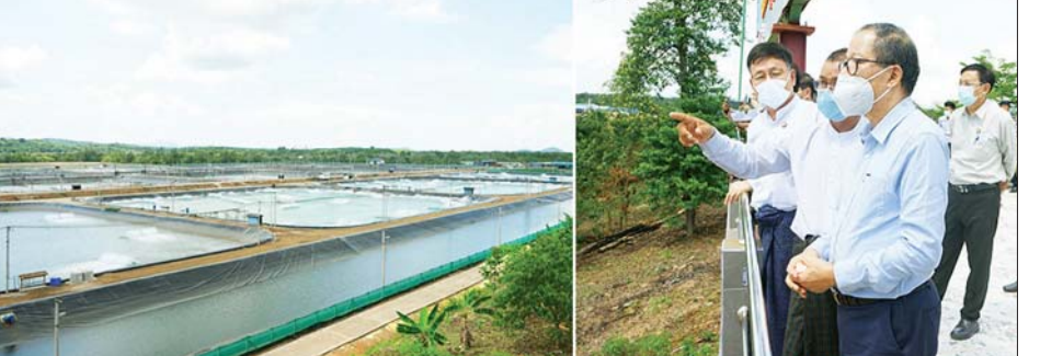
ပြည်ထောင်စုဝန်ကြီး ဦးတင်ထွဋ်ဦး ပုဂ္ဂလိကလုပ်ငန်းရှင်များ၏ GAP စနစ်ဖြင့် မွေးမြူထုတ်လုပ်လျက်ရှိသည့် ကဏန်းနှင့် ပုစွန်မွေးမြူရေးလုပ်ငန်းများကို ကြည့်ရှုစစ်ဆေးစဉ်။

ရှိရန်လိုအပ်ကြောင်း၊ သို့မှသာ ဒေသနေပြည်သူများ၏ အလုပ်အကိုင်၊ ဝင်ငွေစီးပွားရေးနှင့် လူနေမှုအဆင့်အတန်းများ မြင့်မားလာမည်ကို အထူးသတိပြုကြရမည်ဖြစ်ပါကြောင်း။ တနင်္လာရီတိုင်း ဒေသကြီးအနေဖြင့် စားအုန်းဆီစိုက်ပျိုးထုတ်လုပ်နိုင်ခြင်း၊ ရော်ဘာ၊ ကိုကိုးနှင့် အခြားဥယျာဉ်ခြံသီးနှံစိုက်ပျိုးထုတ်လုပ်နိုင်သည့်အပြင် ပင်လယ်ငါးဖမ်းလုပ်ငန်း၊ ငါးပစ္စန်းမွေးမြူရေးလုပ်ငန်းနှင့် ရေထွက်ကုန်များ စုလင်စွာဖြင့် စီးပွားဖြစ်ထုတ်လုပ်နိုင်သည့် ဝိသေသ