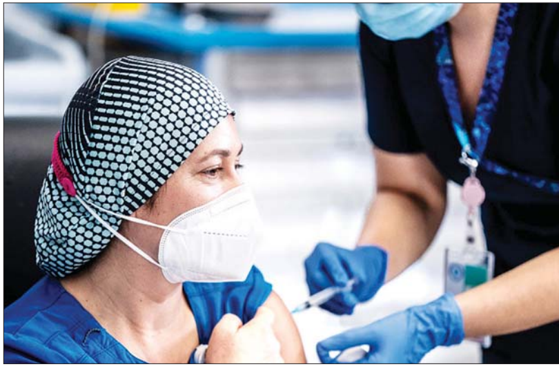
ချိုလီနိုင်ငံတွင် ကိုဗစ်-၁၉ ကာကွယ်ဆေး ထိုးပေးနေစဉ်။