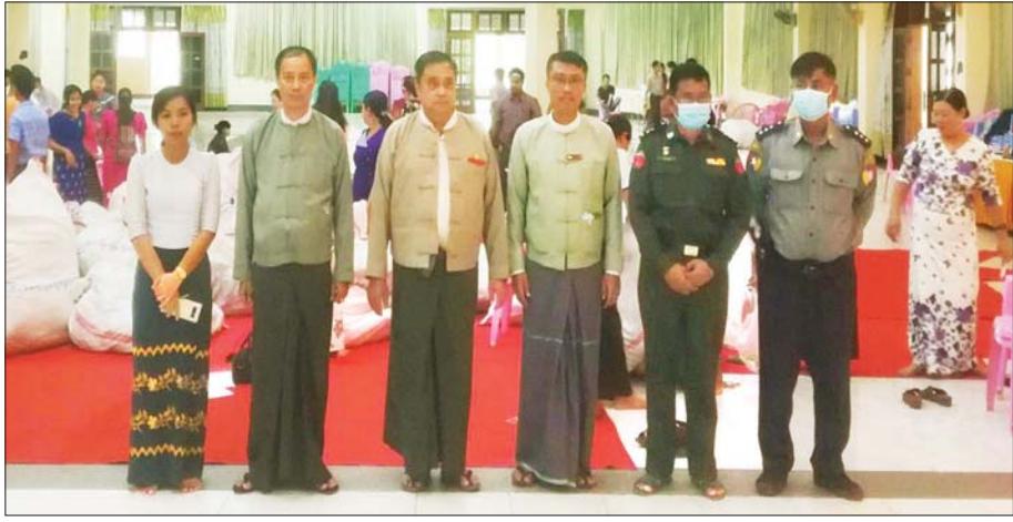
မော်လမြိုင်မြို့နယ် ဆန္ဒမဲလက်မှတ် မြေပြင်စစ်ဆေးမှု မှတ်တမ်းဓာတ်ပုံ။

ကျိုက်မရောမြို့နယ် ပြည်သူ့လွှတ်တော်ဆန္ဒမဲလက်မှတ်များ မြေပြင်စစ်ဆေးတွေ့ရှိချက် ၈။ မြေပြင်စစ်ဆေးချက်များအရ မွန်ပြည်နယ်၊ ကျိုက်မရောမြို့နယ်တွင် ရပ်ကွက် ၄ ရပ်ကွက်၊ ကျေးရွာအုပ်စု ၄၃ အုပ်စု၊ မဲရုံပေါင်း ၉၈ ရုံ၊ ထုတ်ယူရရှိခဲ့သော ဆန္ဒမဲလက်မှတ် အရေအတွက်မှာ ၂၀၄၉၉၅ ဖြစ်ပြီး၊ မဲပေးအသုံးပြုခဲ့သော လက်မှတ်ဖြတ်ပိုင်းများမှာ ၈၈၉၇၈ ၊ ကျန်ရှိရမည့် အရေအတွက်မှာ ၁၁၆၀၁၇ ဖြစ်သော်လည်း မြေပြင်လက်ကျန် ၁၁၄၃၁၄ ဖြစ်ကြောင်း စိစစ်တွေ့ရှိရပါသည်။ မဲရုံအလိုက် မဲလက်မှတ်အပိုများနှင့် ပျောက်ဆုံးမှုများတွေ့ရှိရပြီး စိစစ်တွေ့ရှိချက်များမှာ အောက်ပါအတိုင်း ဖြစ်ပါသည်-