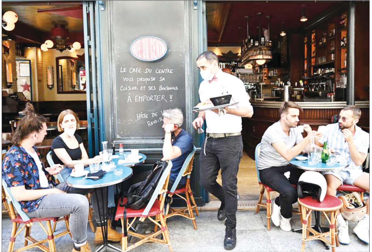
ယမန်နှစ်က ပါရီမြို့၊ စားသောက်ဆိုင်တစ်ဆိုင်တွင် ဆိုင်ထိုင်စားသုံးနေကြသူများကို တွေ့ရစဉ်။

ဧပြီ ၂၉ ရက်တွင် လူပေါင်း ၂၆၅၃၈ ဦးထက်မနည်း ကိုဗစ်-၁၉ ဆေးစစ်မှုများ ပြုလုပ်ခဲ့ပြီး နေ့စဉ်ကူးစက်မှု ၃၀၀၀၀ အောက် လျော့ ကျလာသည်ကို တွေ့ရသည်။ တစ်တိုင်းပြည်လုံးအနှံ့ ကိုဗစ်-၁၉ ကူးစက်မှုမှာ ၅ ဒသမ ၅၉ သန်းရှိသည်။ ကိုဗစ်-၁၉ ကြောင့် ဆေးရုံ တက်ရသူ အရေအတွက်နှင့် စိုးရိမ်ရသည့် လူနာဦးရေမှာလည်း ဧပြီ ၃၀ ရက်တွင် သုံးရက်ဆက်တိုက်ကျဆင်းလာပြီဟု သိရသည်။ ယခု