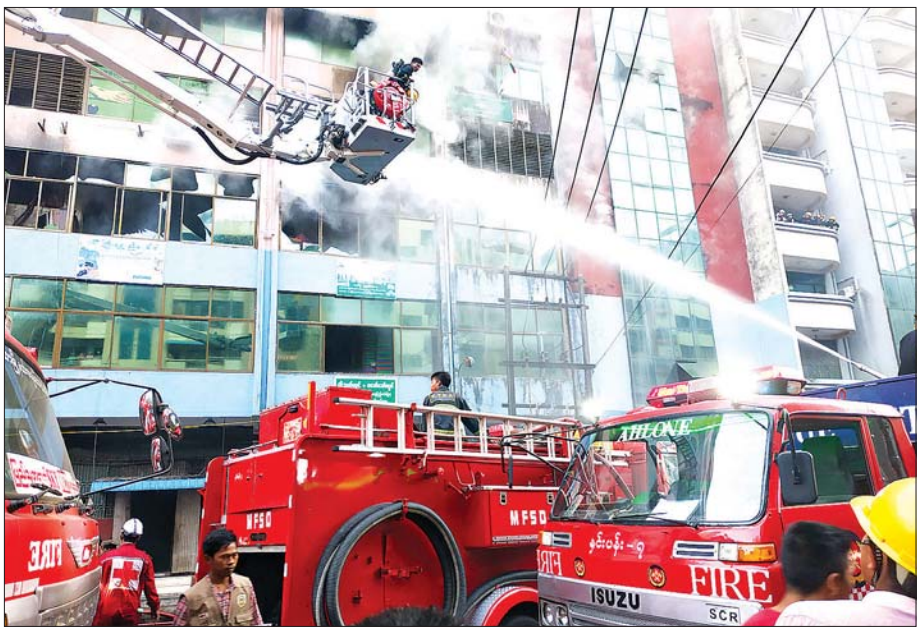
ရန်ကုန်မြို့၊ လသာမြို့နယ် လမ်းမတော်လမ်းရှိ သံဈေး၌ မီးလောင်မှုဖြစ်ပွားရာ မီးသတ်တပ်ဖွဲ့ဝင်များ မီးငြိမ်းသတ်မှုကို တွေ့ရစဉ်။ (၂၀-၂-၂၀၂၀)

မြန်မာနိုင်ငံနှင့်ထိစပ်လျက်ရှိသော ပင်လယ်ပြင်များမှတစ်ဆင့် ဖြတ်ကျော်လာသော မိုးကြိုးမုန်တိုင်းနှင့် မုန်တိုင်းများ၊ တောင်တန်းများပေါ်မှ အထိန်း