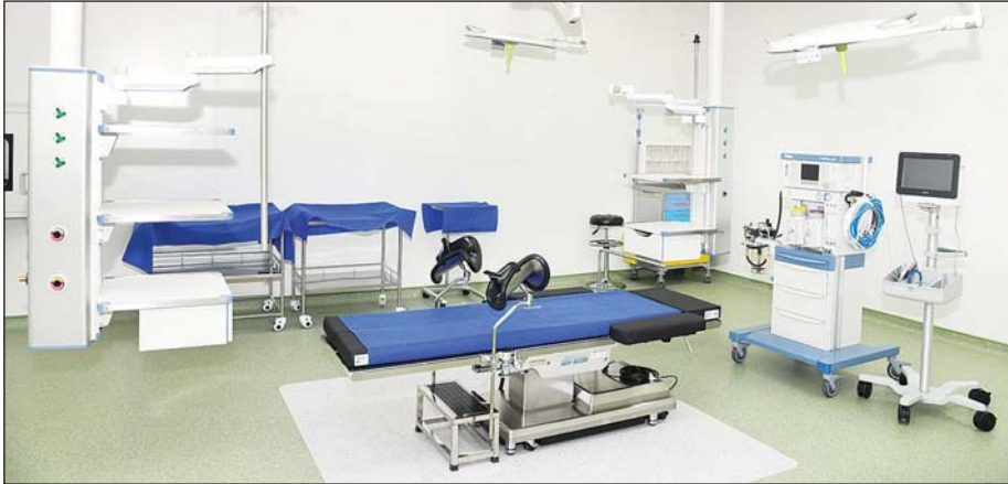
မိုးကောင်းရတနာ မိခင်နှင့်ကလေးဆေးရုံအတွင်း ခေတ်မီစက်ပစ္စည်းကိရိယာများကို တွေ့ရစဉ်။