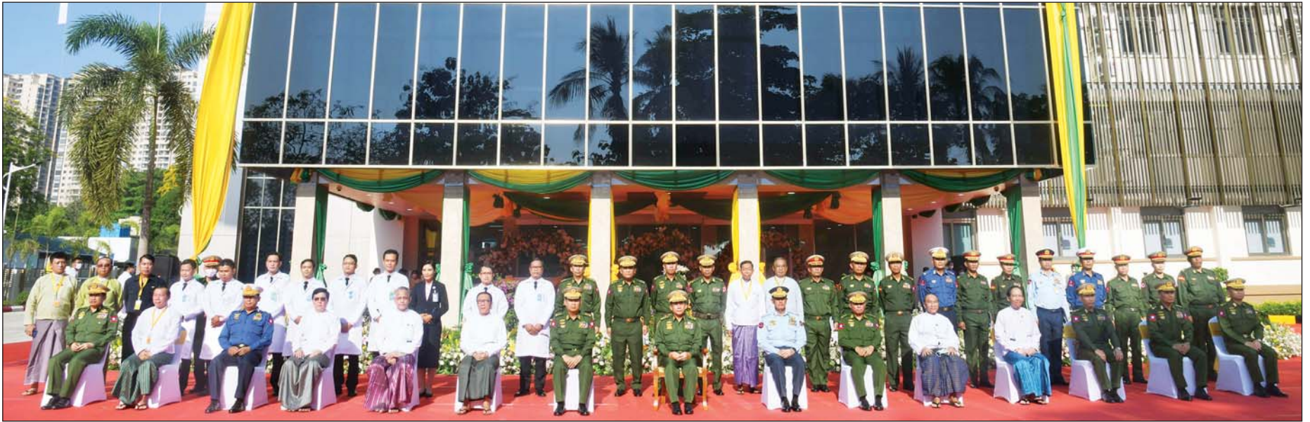
နိုင်ငံတော်စီမံအုပ်ချုပ်ရေးကောင်စီဥက္ကဋ္ဌ တပ်မတော်ကာကွယ်ရေးဦးစီးချုပ် ဗိုလ်ချုပ်မှူးကြီး မင်းအောင်လှိုင်၊ ပြည်ထောင်စုဝန်ကြီးများနှင့် တာဝန်ရှိသူများ မိုးကောင်းရတနာ မိခင်နှင့်ကလေးဆေးရုံဖွင့်ပွဲအခမ်းအနားတင် ဓာတ်ပုံရိုက်စဉ်။