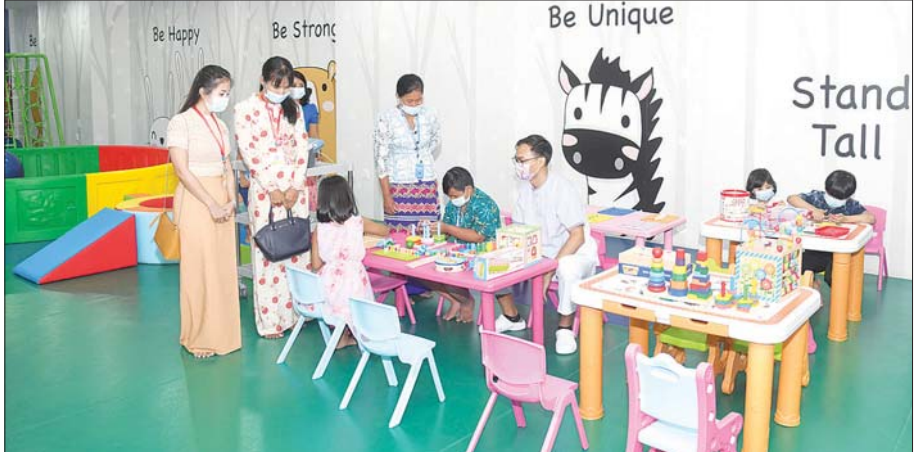
မိုးကောင်းရတနာ မိခင်နှင့်ကလေးဆေးရုံအတွင်း မိခင်နှင့် ကလေးငယ်များအတွက် ဝန်ဆောင်မှု ပေးနေသည်ကို တွေ့ရစဉ်။