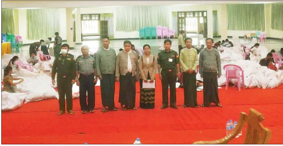
ကျိုက်မရောမြို့နယ် ဆန္ဒမဲလက်မှတ် မြေပြင်စစ်ဆေးမှု မှတ်တမ်းဓာတ်ပုံ။