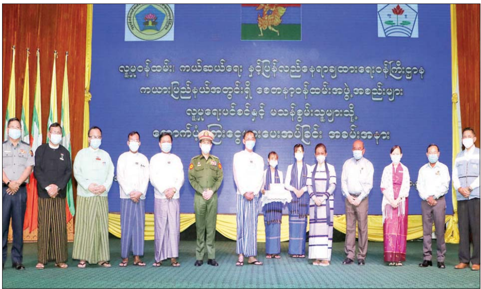
ပြည်ထောင်စုဝန်ကြီး ဒေါက်တာသက်သက်ခိုင် ကယားပြည်နယ်အတွင်းရှိ စေတနာ့ဝန်ထမ်းအဖွဲ့အစည်းများ၊ မသန်စွမ်းသူများနှင့် သက်ကြီးရွယ်အိုများအတွက် ထောက်ပံ့ခြင်းအခမ်းအနားတွင် တက်ရောက်ကြသူများနှင့် စုပေါင်းမှတ်တမ်းတင် ဓာတ်ပုံရိုက်စဉ်။

အခမ်းအနားသို့ လူမှုဝန်ထမ်း၊ ကယ်ဆယ်ရေးနှင့် ပြန်လည်နေရာချထားရေးဝန်ကြီးဌာန ပြည်ထောင်စုဝန်ကြီး ဒေါက်တာသက်သက်ခိုင်၊ ကယားပြည်နယ်စီမံအုပ်ချုပ်ရေးကောင်စီ ဥက္ကဋ္ဌ ဦးခင်မောင်ဦး၊ လူမှုဝန်ထမ်း၊ ကယ်ဆယ်ရေးနှင့် ပြန်လည်နေရာချထားရေး ဝန်ကြီးဌာန ဒုတိယဝန်ကြီး ဦးအောင်ထွန်းခိုင်၊ ဒေသကွပ်ကဲမှုစစ်ဌာနချုပ်(လွိုင်ကော်) မှ ဒေသကွပ်ကဲရေးမှူး ဗိုလ်မှူးချုပ် ထွန်းနိုင်ဦး၊ ပြည်နယ်စီမံအုပ်ချုပ်ရေး ကောင်စီဝင်များ၊ ညွှန်ကြားရေးမှူးချုပ်များ၊ ဌာနဆိုင်ရာ အကြီးအကဲများ၊ မြို့မိမြို့ဖများ၊ စေတနာ့ဝန်ထမ်းအဖွဲ့ အစည်းများမှကိုယ်စားလှယ်များနှင့် မသန်စွမ်းပုဂ္ဂိုလ်များ တက်ရောက်ကြသည်။