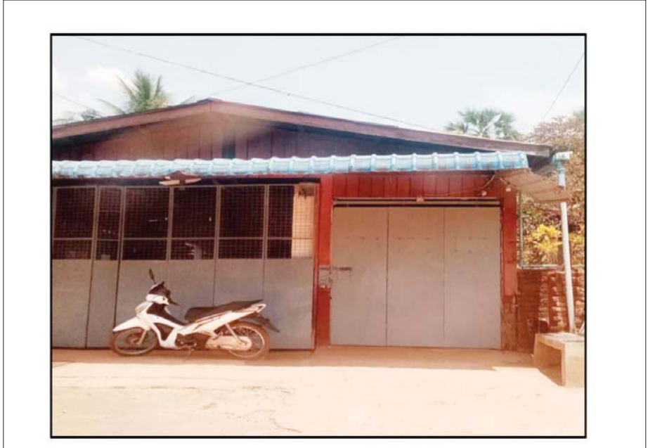
ဒေါက်တာ ဆွေဆွေခိုင် (လ/ထ ဆရာဝန်၊ ကော့ကရိတ်ခရိုင်ပြည်သူ့ဆေးရုံ )ဆေးကုသနေသည့် အမည်မရှိဆေးခန်းမှတ်တမ်းဓာတ်ပုံ