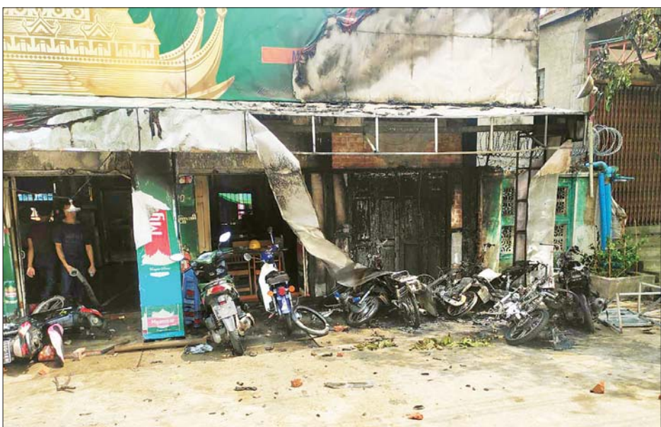
ဆူပူအကြမ်းဖက်သူများ မီးရှို့ဖျက်ဆီးမှုကြောင့် ပျက်စီးသွားသည့် အဆောက်အအုံနှင့် ဆိုင်ကယ်များကို တွေ့ရစဉ်။

နေပြည်တော် မေ ၂ စစ်ကိုင်းတိုင်းဒေသကြီး ဝက်လက်မြို့နယ်၌ ပြည်ထောင်စုကြံ့ခိုင်ရေးနှင့် ဖွံ့ဖြိုးရေးပါတီဝင် တစ်ဦး၏နေအိမ်အား မေ ၂ ရက်တွင် ဆူပူအကြမ်းဖက် သူများက ဝိုင်းဝန်းရန်ပြု တိုက်ခိုက် မီးရှို့ဖျက်ဆီး ခဲ့မှုကြောင့် နေအိမ်မှန်များ ကွဲအက်ပျက်စီးကာ သို့လှောင်ရုံအဆောက်အအုံတစ်လုံးနှင့် ဆိုင်ကယ် ကိုးစီးတို့ မီးလောင်ပျက်စီးဆုံးရှုံးခဲ့ကြောင်း သိရ သည်။