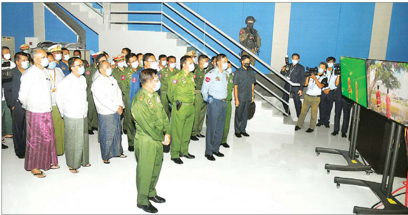
နိုင်ငံတော်စီမံအုပ်ချုပ်ရေးကောင်စီဥက္ကဋ္ဌ တပ်မတော်ကာကွယ်ရေးဦးစီးချုပ် ဗိုလ်ချုပ်မှူးကြီး မင်းအောင်လှိုင်နှင့်အဖွဲ့ဝင်များ မြဝတီမီဒီယာစင်တာအတွင်း ကြည့်ရှုစဉ်။

ခေတ်နှင့်အညီ ပြောင်းလဲတိုးတက်နေသည့် သတင်းမီဒီယာ IT ခေတ်တွင် သတင်းရရှိပေးပို့မှုများ အင်မတန်လျင်မြန်လာသကဲ့သို့ သတင်းဖော်ပြမှုနှင့် အထောက်အကူပစ္စည်းများ၊ နည်းပညာများသည်လည်း တစ်ရက်နှင့်တစ်ရက် မတူအောင် တိုးတက်ပြောင်းလဲနေကြောင်း၊ ပြိုင်ဆိုင်မှုများပြီး လျင်မြန်လွန်းသည့် မီဒီယာခေတ်တွင် မှန်ကန်တိကျသည့် သတင်းဖော်ပြမှုသည် အရေးပါပြီး မှားယွင်းဖော်ပြမိသည်နှင့်အမျှ တရားစွဲဆိုခံရမှုများ ဖြစ်လာနိုင်သကဲ့သို့ ခေတ်နှင့်အညီ ပြောင်းလဲတိုးတက်နေသည့် သတင်းမီဒီယာပညာများသည်လည်း လေ့လာသင်ယူစရာများစွာရှိနေကြောင်း၊ မီဒီယာနှင့်ပြည်သူ့ဆက်ဆံရေးဆိုင်ရာ မိမိအဖွဲ့အစည်းလုပ်ငန်းများကို လူသိများစေရန် ဆောင်ရွက်သည့်အခါတွင် ပြည်သူ့ဆက်ဆံရေးလုပ်ငန်းများ၏ အစိတ်အပိုင်းတစ်ရပ်ဖြစ်ကြောင်း၊ ပြည်သူ့ဆက်ဆံရေးလုပ်ငန်းများတွင် အများပြည်သူနှင့်ဆက်ဆံရေး၊ မိမိအသိုက်အဝန်းနှင့်ဆက်ဆံရေး၊ မိမိကို ထောက်ပံ့သူများနှင့် ဆက်ဆံရေးဟူ၍ ဆက်ဆံရေးအမျိုးမျိုး ပါဝင်လျက်ရှိကြောင်း၊ မိမိသိစေချင်သည့် အကြောင်းအရာတစ်ရပ်ကို လူအများသိရှိလာစေရန် မီဒီယာမှတစ်ဆင့် ဆောင်ရွက်နိုင်ကြောင်း၊ ထို့ကြောင့် မီဒီယာဆက်ဆံရေးသည် လူသိများစေရန် ဆောင်ရွက်သည့် လုပ်ငန်းတစ်ရပ်ဖြစ်ပြီး မိမိအနေဖြင့် ပြောရမည်ဆိုပါက မီဒီယာလုပ်ငန်းသည် အတွေးအခေါ်ကောင်းရမည်၊ စက်မှုပိုင်းဆိုင်ရာ ကောင်းရမည်၊ နည်းပညာပိုင်းဆိုင်ရာ ကောင်းရမည်၊ သရုပ်ဆောင်မှုပိုင်းတွင် အရုပ်နှင့် အသံပိုင်းဆိုင်ရာကောင်းရမည်၊ သံစဉ်များ ဟာမိုနီဖြစ်ရမည်၊ ပရိသတ်ကို သုတ၊ ရသပေးနိုင်ရမည်ဖြစ်ပြီး စိတ်ဓာတ်ခွန်အားရစေရမည်ဖြစ်ကြောင်းနှင့် ကြည့်ရှုသူတို့၏ ရင်ထဲတွင် စွဲထင်ကျန်