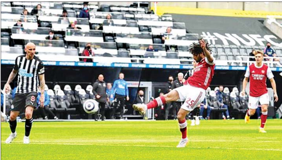
အာဆင်နယ်အသင်းမှ အယ်နီနီ နယူးကာဆယ်အသင်းဘက်သို့ ရိုးသွင်းယူရန် ကြိုးပမ်းမှုကို တွေ့ရစဉ်။

ပရီမီယာလိဂ်ပွဲစဉ် (၃၄) အဖြစ် နယူးကာဆယ် အသင်းနှင့် အာဆင်နယ်အသင်းတို့ပွဲစဉ်ကို မေ ၂ ရက် ညပိုင်းက နယူးကာဆယ်အိမ်ကွင်း၌ ယှဉ်ပြိုင် ကစားခဲ့ရာ အာဆင်နယ်အသင်းက နှစ်ဂိုး-ဂိုးမရှိဖြင့် အနိုင် ရရှိခဲ့သည်။ အာဆင်နယ်အသင်းသည် ယနေ့ပွဲစဉ်ကို အနိုင်ရရှိ ခဲ့သောကြောင့် အမှတ်ပေးဇယား အဆင့် (၉) နေရာကို တက်လှမ်း နိုင်ခဲ့သည်။ နယူးကာဆယ် အသင်းက ယခုပွဲစဉ်ကို ရှုံးနိမ့်ခဲ့ သည့်အတွက် တန်းဆင်းစန့် စာမျက်နှာ ၁၁ ကော်လံ ၁