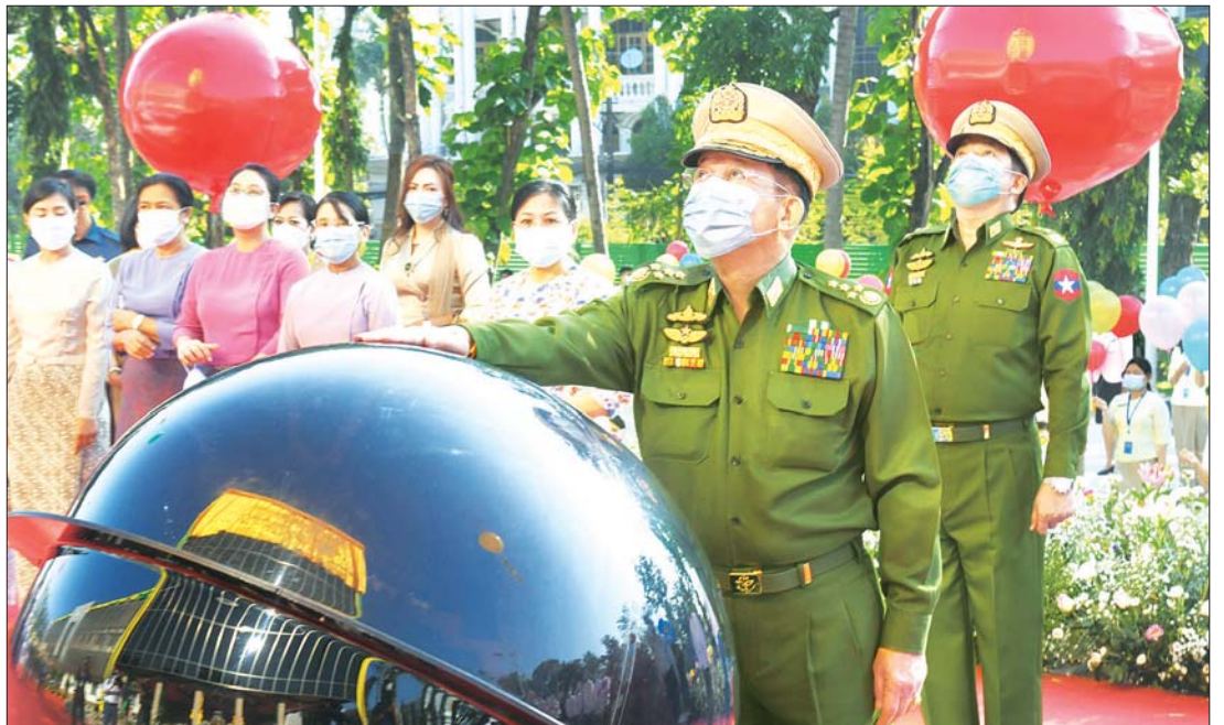
နိုင်ငံတော်စီမံအုပ်ချုပ်ရေးကောင်စီဥက္ကဋ္ဌ တပ်မတော်ကာကွယ်ရေးဦးစီးချုပ် ဗိုလ်ချုပ်မှူးကြီး မင်းအောင်လှိုင် မိုးကောင်းရတနာ မိခင်နှင့်ကလေးဆေးရုံကို စက်ခလုတ်နှိပ် ဖွင့်လှစ်ပေးစဉ်။ သတင်းစဉ်

မိမိတို့ပြည်သူလူထုများအနေဖြင့် ကျန်းမာရေးဝန်ဆောင်မှု ဆောင်ရွက်ရာတွင် ပြည်ပနိုင်ငံများသို့ သွားရောက်ဆေးကုသမှုများ ဈေးကွက်ကို အစားထိုးနိုင်ရန်ဖြစ်ပြီး ဘာသာစကားကန့်သတ်ချက်ကို ကျော်လွှားနိုင်ရန်၊ ဆရာဝန်များနှင့် အရေးပေါ်ချိတ်ဆက်ဆွေးနွေးဆောင်ရွက်မှု အခက်အခဲများ မရှိစေရန်၊ ဒေသတွင်းပြည်သူလူထုများအတွက် နိုင်ငံတကာအဆင့်မီ ဆေးကုသမှု ခံစားရရှိနိုင်စေရန်၊ မိသားစုနှင့်အတူ အိုးမကွာအိမ်မကွာ နွေးထွေးသည့် ကုသခံစားမှုမျိုး ရရှိနိုင်စေရန်၊ ဆေးရုံနှင့်လူနာ မမျှတမှုကို ဖြည့်ဆည်းပေးနိုင်စေရန်နှင့် အဆင့်မြင့်ရောဂါ ရှာဖွေကုသရေးဆိုင်ရာ စက်ပစ္စည်းကိရိယာ နှင့် နည်းပညာအဆင့်မြင့်မားသည့် ကုသမှုများကို ပြည်သူလူထုအများရရှိနိုင်စေရန် ရည်ရွယ်