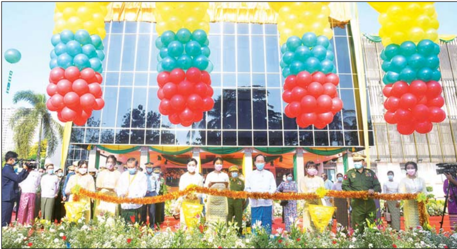
ပြည်ထောင်စုဝန်ကြီး ဒေါက်တာ သက်ခိုင်ဝင်း၊ ရန်ကုန်တိုင်းဒေသကြီး စီမံအုပ်ချုပ်ရေးကောင်စီဥက္ကဋ္ဌ ဦးလှစိုးနှင့် မြန်မာစီးပွားရေးကော်ပိုရေးရှင်းဥက္ကဋ္ဌ ဒုတိယဗိုလ်ချုပ်ကြီး ညိုစောတို့ မိုးကောင်းရတနာ မိခင်နှင့်ကလေးဆေးရုံကို ဖဲကြိုဖြတ်ဖွင့်လှစ်ပေးစဉ်။