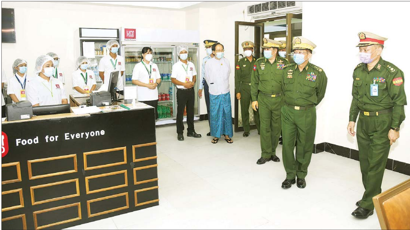
နိုင်ငံတော်စီမံအုပ်ချုပ်ရေးကောင်စီဥက္ကဋ္ဌ တပ်မတော်ကာကွယ်ရေးဦးစီးချုပ် ဗိုလ်ချုပ်မှူးကြီး မင်းအောင်လှိုင်နှင့် အဖွဲ့ဝင်များ မိုးကောင်းရတနာ မိခင်နှင့်ကလေးဆေးရုံအတွင်း ကြည့်ရှုစဉ်။

သော ကလေးငယ်များအား ပြုစုကုသခြင်း၊ ကလေးအာဟာရဆွေးနွေးကုသခြင်း၊ မွေးကင်းစကလေးငယ်များအား အထူးကြပ်မတ်ကုသခြင်းတို့ကို ဆောင်ရွက်ပေးသွားမည်ဖြစ်ကြောင်း၊ လာရောက်ကုသမှုခံယူသည့် မိဘပြည်သူများအတွက် စာတွေ့လက်တွေ့ ကျွမ်းကျင်မှုရှိပြီး အတွေ့အကြုံပြည့်ဝသည့် သူနာပြုနှင့် ပါရဂူဆရာဝန်ကြီးများ၊ ကျွမ်းကျင်ပညာရှင်များက နောက်ဆုံးပေါ် ခေတ်မီစက်ကိရိယာများဖြင့် မိခင်နှင့် ရင်သွေးငယ်များ ကျန်းမာရေးအတွက် ၂၄ နာရီကာလပတ်လုံး အထူးဂရုပြု