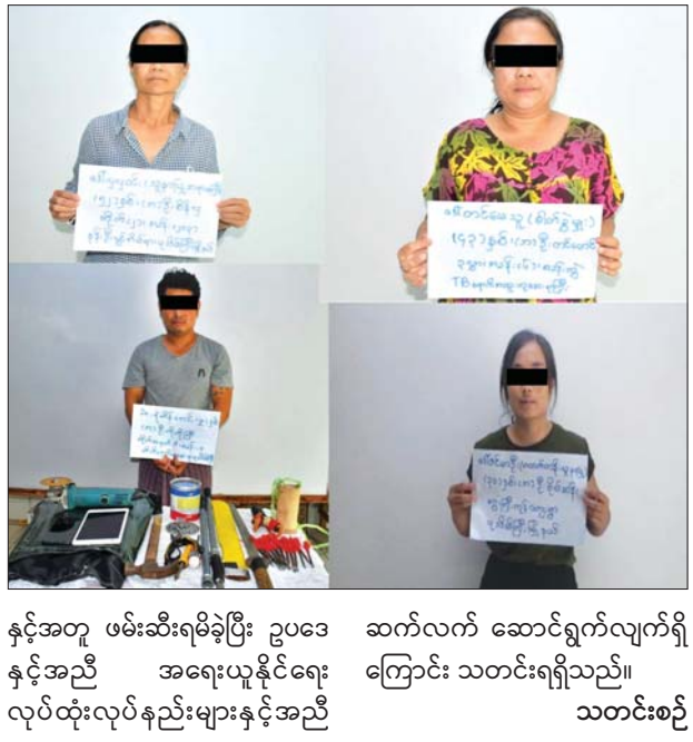
နှင့်အတူ ဖမ်းဆီးရမိခဲ့ပြီး ဥပဒေ ဆက်လက် ဆောင်ရွက်လျက်ရှိ နှင့်အညီ အရေးယူနိုင်ရေး ကြောင်း သတင်းရရှိသည်။ လုပ်ထုံးလုပ်နည်းများနှင့်အညီ သတင်းစဉ်