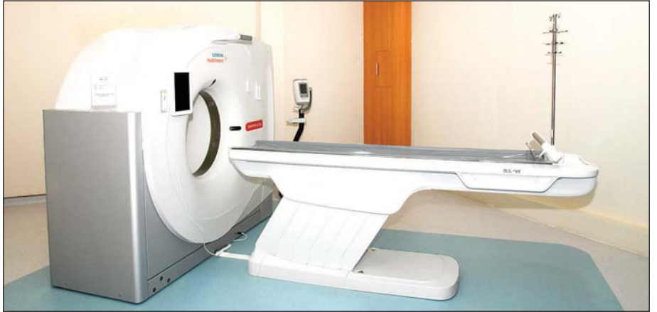
မိုးကောင်းရတနာ မိခင်နှင့်ကလေးဆေးရုံအတွင်း ခေတ်မီစက်ပစ္စည်းကိရိယာများကို တွေ့ရစဉ်။