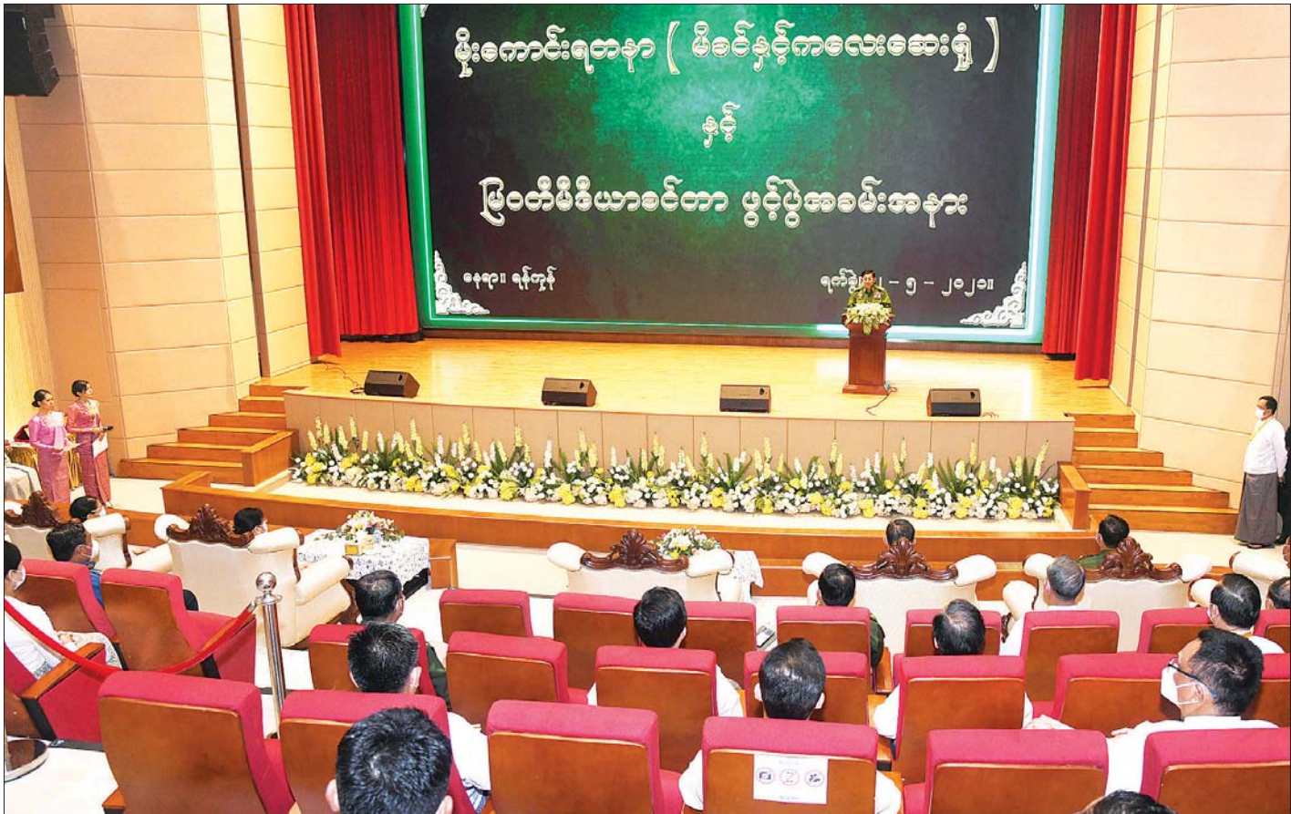
နိုင်ငံတော်စီမံအုပ်ချုပ်ရေးကောင်စီဥက္ကဋ္ဌ တပ်မတော်ကာကွယ်ရေးဦးစီးချုပ် ဗိုလ်ချုပ်မှူးကြီး မင်းအောင်လှိုင် မိုးကောင်းရတနာ မိခင်နှင့် ကလေးဆေးရုံနှင့် မြဝတီမီဒီယာစင်တာ ဖွင့်ပွဲအခမ်းအနားများတွင် အမှာစကားပြောကြားစဉ်။

မိုးကောင်းရတနာ မိခင်နှင့်ကလေးဆေးရုံသည် တပ်မတော်ကာကွယ်ရေးဦးစီးချုပ်၏ လမ်းညွှန်ချက်ဖြစ်သည့် မိမိနိုင်ငံအတွင်း နိုင်ငံသူနိုင်ငံသားများအား ကိုးအားထားပြုရသည့် နိုင်ငံတကာအဆင့်မီ နိုင်ငံတကာအသိအမှတ်ပြု မိခင်နှင့် ကလေးဆေးရုံကြီးအဖြစ် ပုဂ္ဂလိကကျန်းမာရေးကဏ္ဍအား အထောက်အကူပြုပေးနိုင်ရန် ရည်ရွယ်၍ တည်ဆောက်ခဲ့ခြင်းဖြစ်ကြောင်း၊ အဆိုပါ ဆေးရုံတွင် မိခင်နှင့် ကလေးဆိုင်ရာ ကျန်းမာရေးဝန်ဆောင်မှုအနေဖြင့် ဖန်ပြန်သန္ဓေသားပြုလုပ်ခြင်း၊ မျိုးရိုးဗီဇများ သိမ်းဆည်းခြင်း၊ မျိုးရိုးလိုက် ရောဂါရှာဖွေစစ်ဆေးခြင်း၊ တစ်သက်တာ ကာကွယ်ဆေးထိုးလုပ်ငန်းများ ဆောင်ရွက်ပေးခြင်း၊ ဖွံ့ဖြိုးမှုနောက်ကျ