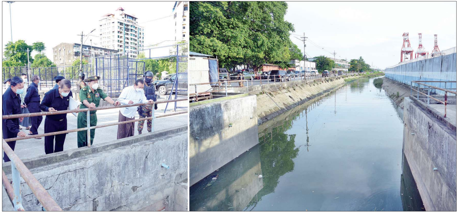
နိုင်ငံတော်စီမံအုပ်ချုပ်ရေးကောင်စီဥက္ကဋ္ဌ၊ တပ်မတော်ကာကွယ်ရေးဦးစီးချုပ် ဗိုလ်ချုပ်မှူးကြီး မင်းအောင်လှိုင် လမ်းမတော်မြို့နယ်ရှိ ရွာသစ်ချောင်း မြစ်ထွက်ပေါက်ကို ကြည့်ရှုစစ်ဆေးစဉ်။

“အချို့စက်ရုံများအား ပြန်လည် လည်ပတ်နိုင်ရေး ကြိုးပမ်းဆောင်ရွက်၍ ပြည်တွင်းစက်သုံးဆီ လိုအပ်ချက်အား တစ်ဖက်တစ်လမ်းမှ ဖြည့်ဆည်းပေးနိုင်ရန် မှာကြားပြီး လိုအပ်သည်များ ဖြည့်ဆည်း ဆောင်ရွက်ပေးခဲ့”