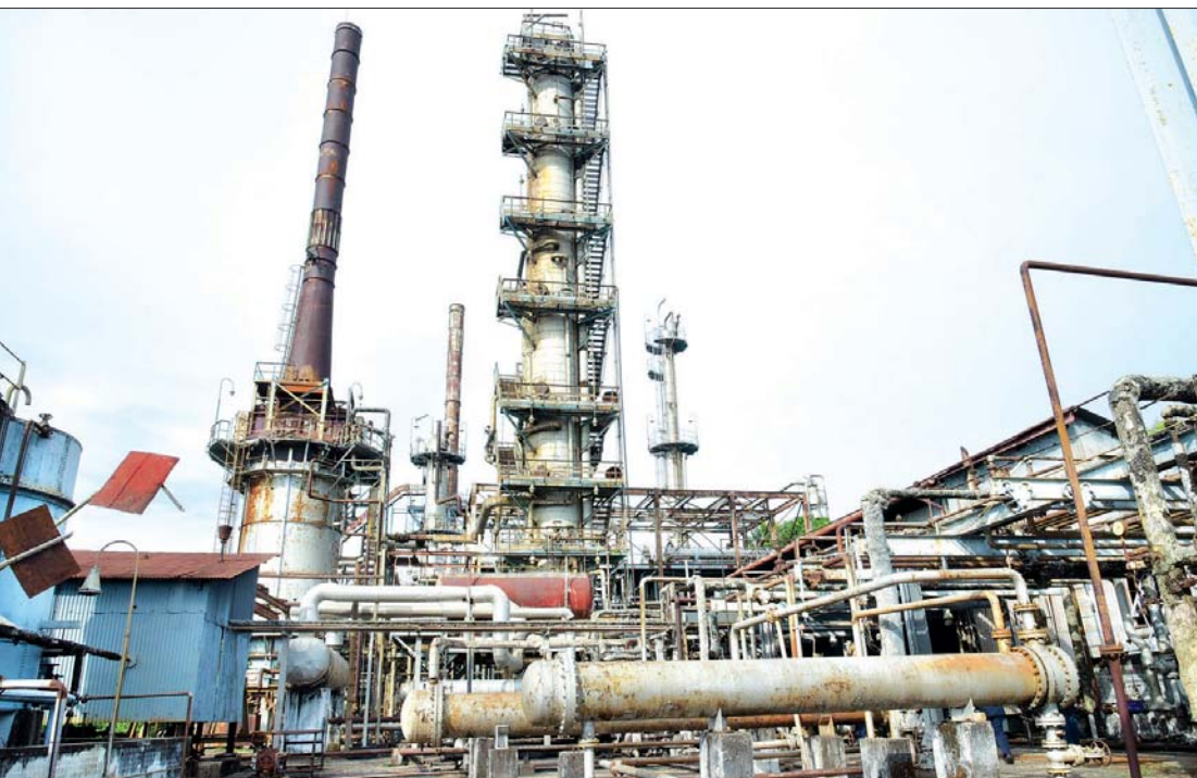
အမှတ်(၁) ရေနံချက်စက်ရုံ (သန်လျင်) ကို တွေ့ရစဉ်။