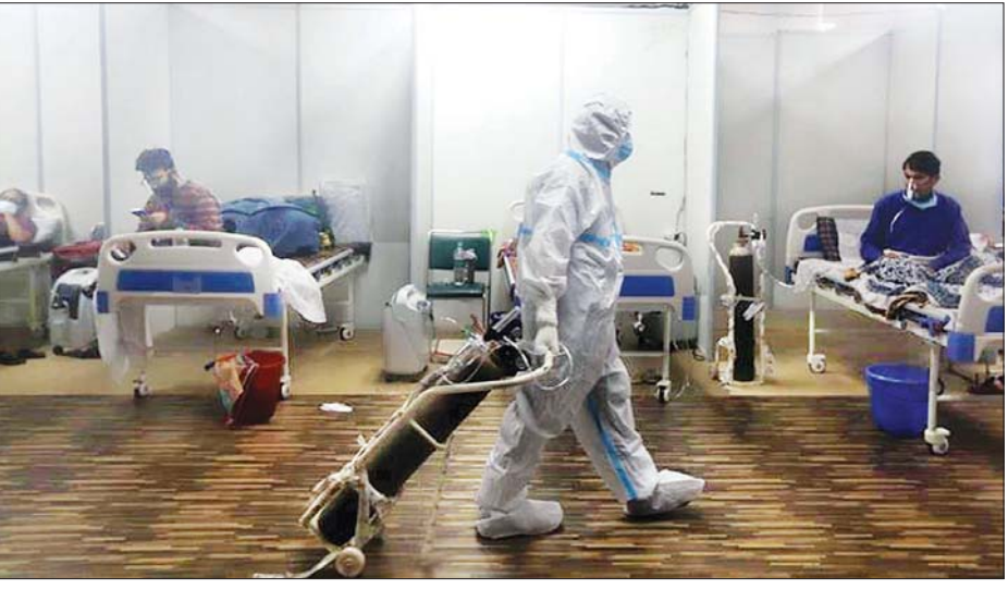
နယူးဒေလီရှိဆေးရုံတစ်ရုံတွင် တက်ရောက်ကုသနေသည့် လူနာများကို တွေ့ရစဉ်။

နယူးဒေလီ ဧပြီ ၃၀ အိန္ဒိယနိုင်ငံတွင် ကိုဗစ်-၁၉ ကူးစက်မှုများ မြင့်မားနေသည့်အတွက် ရောဂါကူးစက်မှုကို ရင်ဆိုင်နိုင်ရန် နိုင်ငံပေါင်း ၄၀ ကျော်မှ အိန္ဒိယကိုအကူအညီပေးရန် ကမ်းလှမ်းထားသည်ဟု သိရသည်။