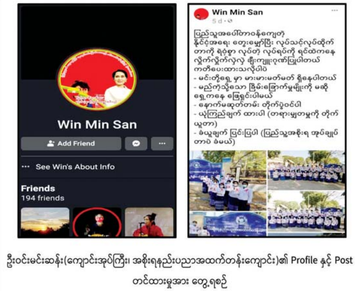
ဦးဝင်းမင်းဆန်း(ကျောင်းအုပ်ကြီး၊ အစိုးရနည်းပညာအထက်တန်းကျောင်း)၏ Profile နှင့် Post တင်ထားမှုအား တွေ့ရစဉ်