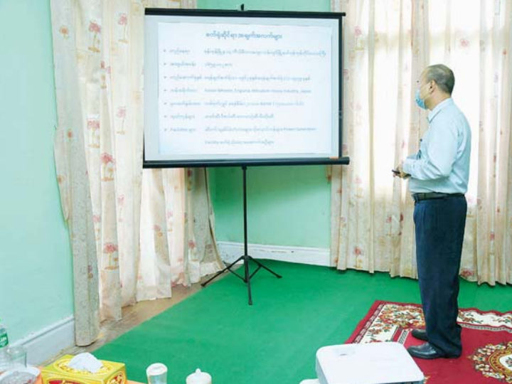
နိုင်ငံတော်စီမံအုပ်ချုပ်ရေးကောင်စီဥက္ကဋ္ဌ၊ တပ်မတော်ကာကွယ်ရေးဦးစီးချုပ် ဗိုလ်ချုပ်မှူးကြီး မင်းအောင်လှိုင်အား အမှတ်(၁) ရေနံချက်စက်ရုံ(သန်လျင်)နှင့်ပတ်သက်၍ တာဝန်ရှိသူတစ်ဦးက ရှင်းလင်းတင်ပြစဉ်။

ဖြစ်ပြီး ပြည်ပမှ လစဉ်တန်ချိန်များစွာ တင်သွင်းနေရသည့် အခြေအနေ၊ ထိုသို့ ပြည်ပမှ တင်သွင်းခြင်းများ ဆောင်ရွက်ရာတွင် ပိုမိုတွင်ကျယ်အောင် သယ်ယူ