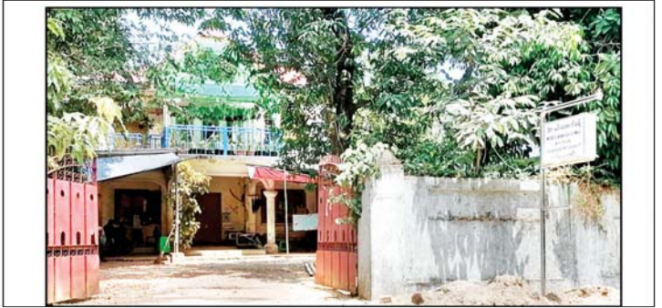
ဒေါက်တာ မင်းအောင်ခန့်(အထူးကု၊ သထုံပြည်သူ့ဆေးရုံ) ဆေးကုသနေသည့် အမည်မရှိ ဆေးခန်းမှတ်တမ်းဓာတ်ပုံ