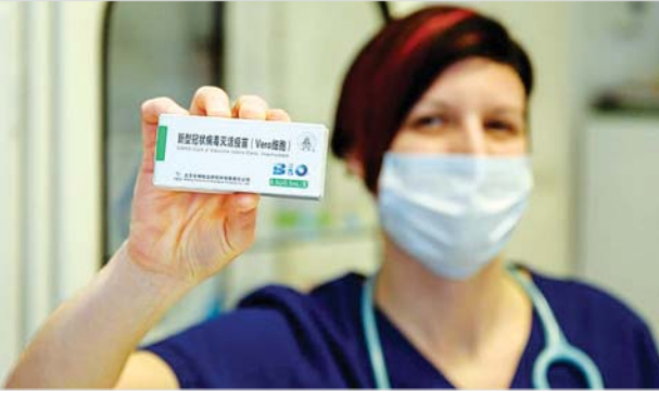
ဟန်ဂေရီနိုင်ငံတွင် တရုတ် ကိုဗစ်-၁၉ ကာကွယ်ဆေးကို ပြသနေ သည့် ကျန်းမာရေးဝန်ထမ်းတစ်ဦးကို တွေ့ရစဉ်။

ကိုဗစ်-၁၉ ကာကွယ်ဆေးများသည် အနောက်နိုင်ငံထုတ် မဟုတ်သော ပထမဆုံး ကိုဗစ်-၁၉ ကာကွယ်ဆေးဖြစ်လာမည်ဖြစ်သည်။ ကမ္ဘာ့ ကျန်းမာရေးအဖွဲ့၏ အတည်ပြုချက်ရရှိခဲ့ပါက ကမ္ဘာ့ကျန်းမာရေးအဖွဲ့ ဦးဆောင်သည့် ကိုဗစ်ကာကွယ်ဆေးအစီအစဉ်အနေဖြင့် တရုတ် ကာကွယ်ဆေးကို ဝယ်ယူဖြန့်ချိခွင့်ရရှိမည် ဖြစ်သည်။ ဆင်ဟွာ