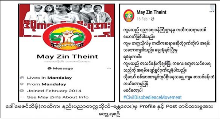
ဒေါ်မေဇင်သိမ့်(ကထိက၊ နည်းပညာတက္ကသိုလ်-မန္တလေး)မှ Profile နှင့် Post တင်ထားမှုအား တွေ့ရစဉ်