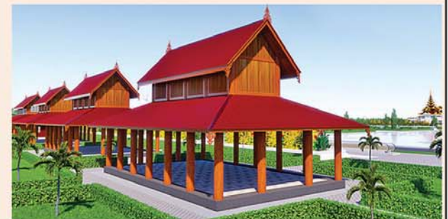
သုဓမ္မာဇရပ်(၅၄x၃၀)ပေ ၆ လုံး ၁ လုံးလျှင်-၅၅၇၇ သိန်း

၁။ နိုင်ငံတော်စီမံအုပ်ချုပ်ရေးကောင်စီဥက္ကဋ္ဌ၊ တပ်မတော်ကာကွယ်ရေးဦးစီးချုပ် ဗိုလ်ချုပ်မှူးကြီးမင်းအောင်လှိုင် ဦးဆောင်သည့် (၇)ရက်သား၊ သမီး၊ တုရားဒါယကာ၊ ဒါယိကာမတို့က မာရဝိဇယပုဒ္ဒရုပ်ပွားတော်မြတ်ကြီးအား မြန်မာနိုင်ငံတွင် ထေရဝါဒ ဗုဒ္ဓသာသနာတော်ထွန်းလင်းတောက်ပလျက်ရှိသည်ကို ကမ္ဘာကိုပြသရန်၊ တိုင်းပြည်အေးချမ်းသာယာမှုရှိစေရန်၊ ရုပ်ပွားတော်မြတ်ကြီးအား ပြည်တွင်း၊ ပြည်ပဘုရားဖူးများလာရောက်ခြင်းဖြင့် ဒေသတိုးတက်စည်ကားမှုကို အထောက်အကူဖြစ်စေရန်၊ နိုင်ငံတော် ဖွံ့ဖြိုးတိုးတက်မှု အထောက်အကူဖြစ်စေရန်ရည်သန်လျက် ပြည်ထောင်စုနယ်မြေ နေပြည်တော်၊ ဒက္ခိဏသီရိမြို့နယ်အတွင်း၌ သာသနာတော်ထုံး၊ ရုပ်ပွားဆင်းတုတော်ထုံး၊ မြန်မာ့ရိုးရာတည်ထုံးများနှင့်အညီ တည်ဆောက်ပူဇော်လျက်ရှိပါသည်။