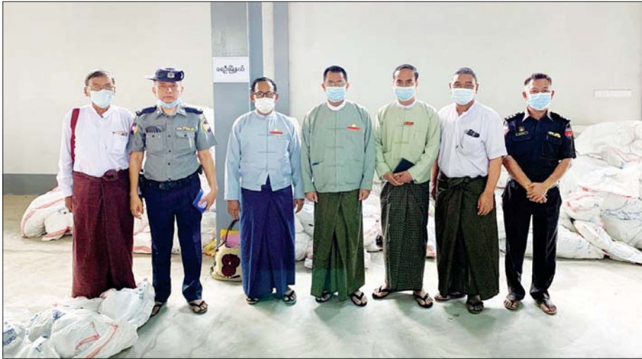
ရေဦးမြို့နယ် ဆန္ဒမဲလက်မှတ်မြေပြင်စစ်ဆေးမှု မှတ်တမ်းဓာတ်ပုံ။