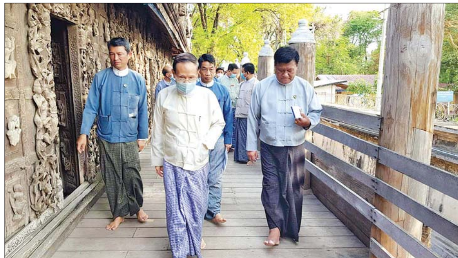
ပြည်ထောင်စုဝန်ကြီး ဦးကိုကို မန္တလေးမြို့ရှိ ရွှေနန်းတော်ကျောင်းကို ကြည့်ရှုစစ်ဆေးစဉ်။

ယဉ်ကျေးမှုစရိုက်လက္ခဏာများ ကို အခြေပြုပြီး မြန်မာ့ရိုးရာ ယဉ်ကျေးမှု အနုပညာပညာရပ် များကို ထိန်းသိမ်းစောင့်ရှောက်နိုင် သည့် မျိုးဆက်သစ် လူငယ်များကို ပြုစုပျိုးထောင်ပေးရန် ဖြစ်ပါ ကြောင်း၊ ထိုမျိုးဆက်သစ်လူငယ် များ၏ နှလုံးသားထဲတွင် ကိုယ့်၊ နှုတ်၊ နှလုံး သုံးပါးစလုံး၏ သိမ်မွေ့ ခြင်းကိုအခြေခံသည့် အမျိုးသား ယဉ်ကျေးမှု စရိုက်လက္ခဏာများ ထာဝစဉ်ကိန်းအောင်းနေရုံမျှမက ထိုအမျိုးသားယဉ်ကျေးမှု စရိုက် လက္ခဏာများ ဆက်လက်ပြန့်ပွား စေရေးကို ဆင်ကမ်းဆောင်ရွက် နိုင်ကြစေရန် လေ့ကျင့်သင်ကြား ပေးသွားရမည် ဖြစ်ပါကြောင်း ပြောကြားသည်။ ထို့နောက် ပြည်ထောင်စု ဝန်ကြီးနှင့် အဖွဲ့သည် တက္ကသိုလ် အတွင်း တည်ဆောက်လျက်ရှိ