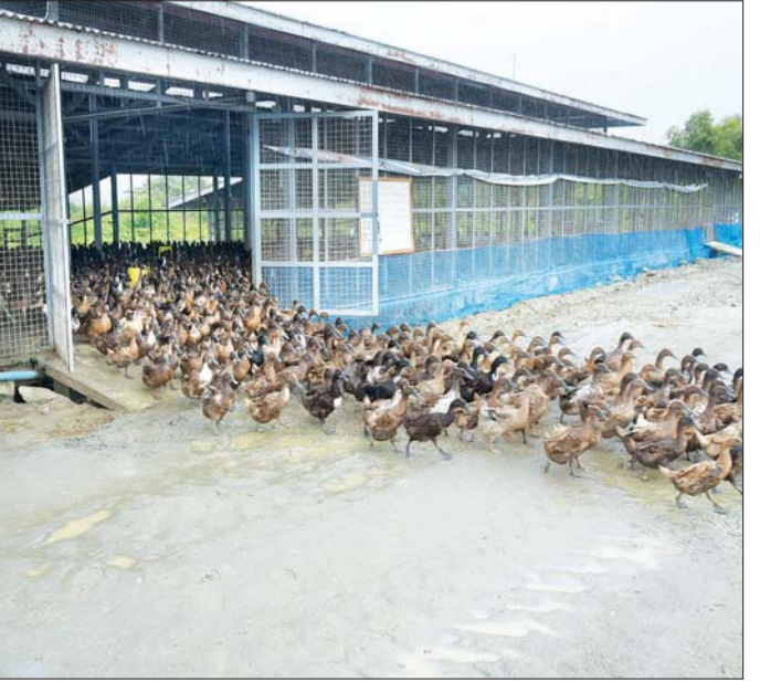
နိုင်ငံတော်စီမံအုပ်ချုပ်ရေးကောင်စီဥက္ကဋ္ဌ၊ တပ်မတော်ကာကွယ်ရေးဦးစီးချုပ် ဗိုလ်ချုပ်မှူးကြီး မင်းအောင်လှိုင် မွေးမြူရေးဇုန်အတွင်း ဘဲမွေးမြူထားရှိမှုကို ကြည့်ရှုစစ်ဆေးစဉ်။