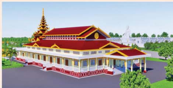
ဓမ္မာရုံ(၂၃၁x၉၀)ပေ ၁ လုံး-၈၇၃၀ သိန်း