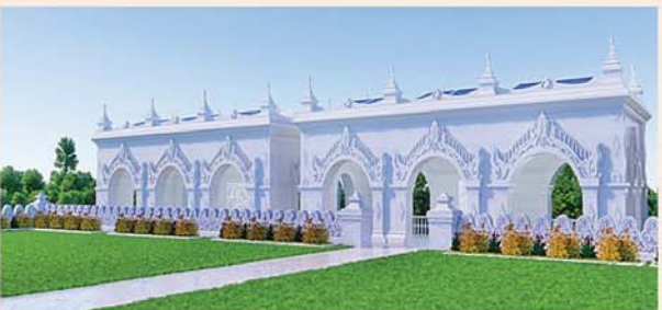
မြန်မာ့မူလကျောက်မြင့် တည်ဆောက်ပူဇော်ထားသော ဂန္ဓကုဋိတိုက် (၅၄x၂၇)ပေ ၂၄ လုံး ၁ လုံးလျှင်- ၁၂၅၀ သိန်း