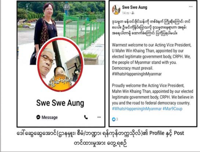
ဒေါ်ဆွေဆွေအောင်(ဌာနမှူး၊ စီမံ/ဘဏ္ဍာ၊ ရန်ကုန်တက္ကသိုလ်)၏ Profile နှင့် Post တင်ထားမှုအား တွေ့ရစဉ်