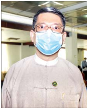
ဦးမင်းမင်း (အမြဲတမ်းအတွင်းဝန်)

ဦးမင်းမင်း (အမြဲတမ်းအတွင်းဝန်၊ စီးပွားရေးနှင့် ကူးသန်းရောင်းဝယ်ရေးဝန်ကြီးဌာန) မေး ။ ။ စီးပွားရေးနှင့် ကူးသန်းရောင်းဝယ်ရေး ဝန်ကြီးဌာနက မေလ ၁ ရက်နေ့ကစပြီး နယ်စပ်ကနေ ကုန်စည်(၄)မျိုး တင်သွင်းခြင်း ကန့်သတ်ရတဲ့ အကြောင်းရင်းကို သိလိုပါတယ်။ ဖြေ ။ ။ အစားအသောက် ဘေးကင်းလုံခြုံမှု ရှိစေ ရေးနဲ့ စနစ်တကျ စစ်ဆေးနိုင်ရေး၊ ပြည်တွင်း SMEs လုပ်ငန်းတွေက ထုတ်လုပ်တဲ့ ကုန်ပစ္စည်းတွေအပေါ် ဈေးကွက်ယှဉ်ပြိုင်မှု အကာ အကွယ်ပေးနိုင်ရေး တင်ပြချက်တွေအရ ၂၀၂၁ ခုနှစ်၊ မေလ ၁ ရက်ကစပြီး နယ်စပ်ဒေသတွေက ယာယီ တင်သွင်းခွင့်မပြုဘဲ ပင်လယ်ရေကြောင်းကသာ တင်သွင်းခွင့်ပြုပေးသွားမှာ ဖြစ်ပါတယ်။