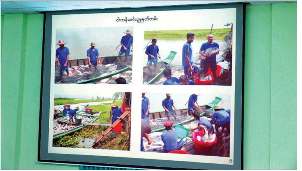
နိုင်ငံတော်စီမံအုပ်ချုပ်ရေးကောင်စီဥက္ကဋ္ဌ၊ တပ်မတော်ကာကွယ်ရေးဦးစီးချုပ် ဗိုလ်ချုပ်မှူးကြီး မင်းအောင်လှိုင်အား သီလဝါဘက်စုံစိုက်ပျိုးမွေးမြူရေးဇုန်အကောင်အထည်ဖော်ဆောင်ရွက်နေမှုနှင့် လုပ်ငန်းလည်ပတ်နေမှုအခြေအနေများနှင့်ပတ်သက်ပြီး တာဝန်ရှိသူတစ်ဦးက ရှင်းလင်းတင်ပြစဉ်။