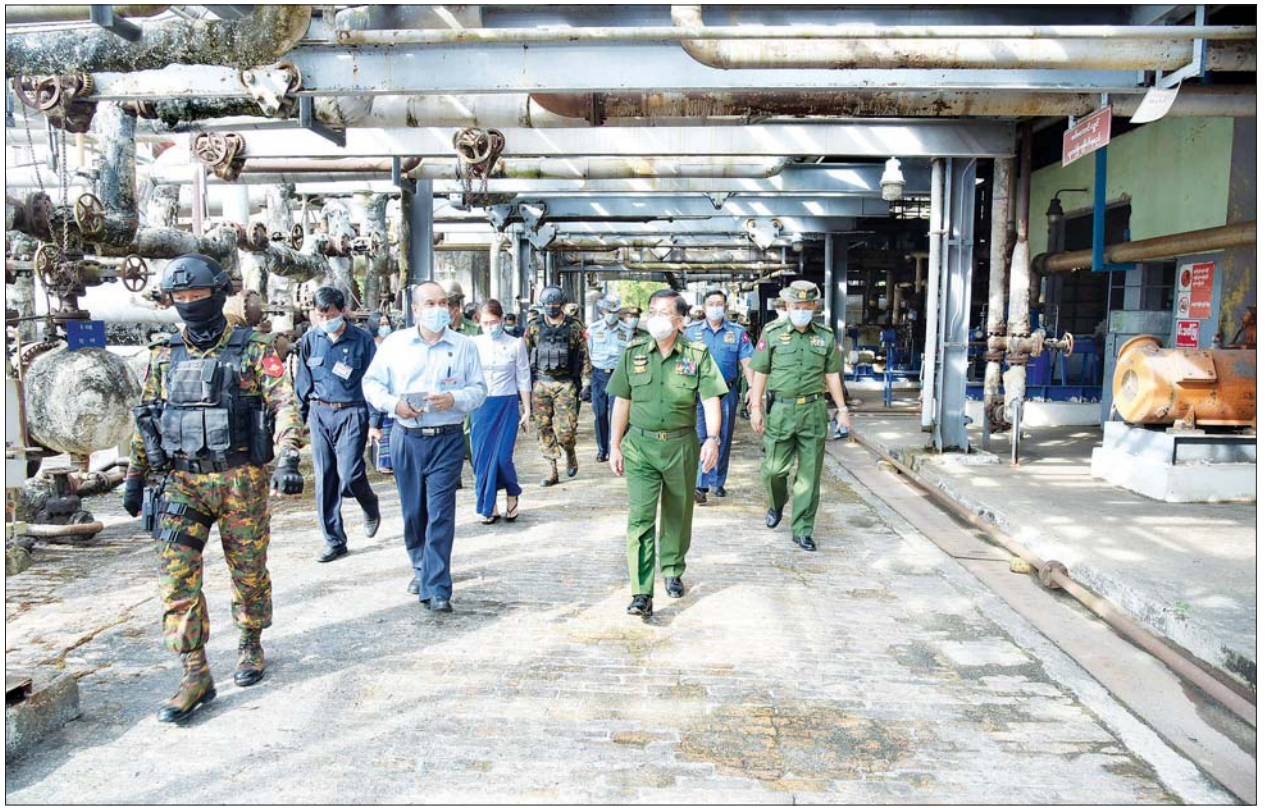
နိုင်ငံတော်စီမံအုပ်ချုပ်ရေးကောင်စီဥက္ကဋ္ဌ၊ တပ်မတော်ကာကွယ်ရေးဦးစီးချုပ် ဗိုလ်ချုပ်မှူးကြီး မင်းအောင်လှိုင် အမှတ်(၁) ရေနံချက်စက်ရုံ (သန်လျင်)အတွင်း ကြည့်ရှုစစ်ဆေးစဉ်။

ယင်းနောက် နိုင်ငံတော်စီမံအုပ်ချုပ်ရေးကောင်စီ ဥက္ကဋ္ဌ တပ်မတော် ကာကွယ်ရေးဦးစီးချုပ်နှင့် အဖွဲ့ဝင်များသည် စက်ရုံဝင်းအတွင်းရှိ ဆီသိုလှောင်ကန်များ၊ ဆိပ်ခံတံတား၊ စက်ဆီရောစပ် စည်သွတ်စက်ရုံနှင့် ရေနံချက်စက်ရုံများအား လိုက်လံကြည့်ရှုစစ်ဆေးပြီး တာဝန်ရှိသူများ၏ တင်ပြချက်များအပေါ် နိုင်ငံတော်စီမံအုပ်ချုပ်ရေးကောင်စီဥက္ကဋ္ဌက အချို့စက်ရုံများအား ပြန်လည်လည်ပတ်နိုင်ရေးကြိုးပမ်းဆောင်ရွက်၍ ပြည်တွင်းစက်သုံးဆီ လိုအပ်ချက်အား တစ်ဖက်တစ်လမ်းမှ ဖြည့်ဆည်းပေးနိုင်ရန် မှာကြားပြီး လိုအပ်သည်များ