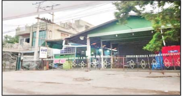
ဒေါက်တာ မေသန့်ဇင်(လ/ထ ဆရာဝန်၊ ရွှေဘိုပြည်သူ့ဆေးရုံ)အား ဆေးကုသခွင့်ပေးထားသည့် “မေမ” ဆေးရုံမှတ်တမ်းဓာတ်ပုံ