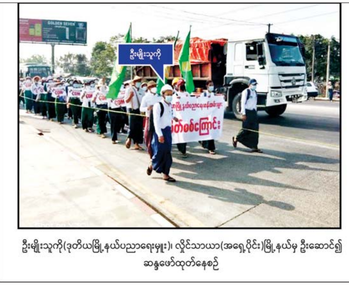
ဦးမျိုးသူကို(ဒုတိယမြို့နယ်ပညာရေးမှူး၊ လှိုင်သာယာ(အရှေ့ပိုင်း)မြို့နယ်မှ ဦးဆောင်၍ ဆန္ဒဖော်ထုတ်နေစဉ်