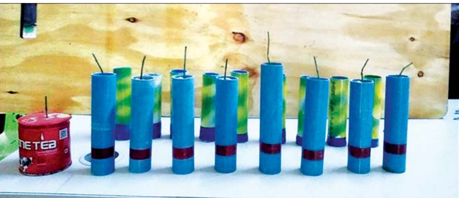
အလုံမြို့နယ်၌ ဆူပူအကြမ်းဖက်ရာတွင် အသုံးပြုသည့် ဆက်စပ်ပစ္စည်းများကို တွေ့ရစဉ်။

လုံခြုံရေးတပ်ဖွဲ့ဝင်များသည် ဆူပူအကြမ်းဖက်မှု လုပ်ရပ်များတွင် အသုံးပြုမည့် လက်နက်၊ ပစ္စည်း၊ ကိရိယာများအား ပြုလုပ်သူ၊ လက်ဝယ်ထားရှိ သူများအား ဆက်လက်ဖော်ထုတ် ဖမ်းဆီးလျက်ရှိသည်။ ထိုသို့ ဆောင်ရွက်ခဲ့ရာတွင် ဧပြီ ၂၉ ရက်နှင့် ယနေ့တို့တွင် စစ်ကိုင်းတိုင်းဒေသကြီး ကလေးမြို့နယ် ပြင်သာကျေးရွာ၌ လုံခြုံရေးတပ်ဖွဲ့ဝင်များက ရပ်ရွာအေးချမ်းသာယာရေးနှင့် တရားဥပဒေစိုးမိုးရေးအတွက်လှည့်ကင်းဆောင်ရွက်နေစဉ် အဆိုပါကျေးရွာ၏ အရှေ့ဘက်ကမ်းရှိ လူမနေသည့် တဲအတွင်းမှ ဆူပူအကြမ်းဖက်မှု ပြုလုပ်ရာတွင် အသုံးပြုသည့် တူးမီးသေနတ် သုံးလက်နှင့် PSI စလောင်း တစ်ခုကိုလည်းကောင်း၊