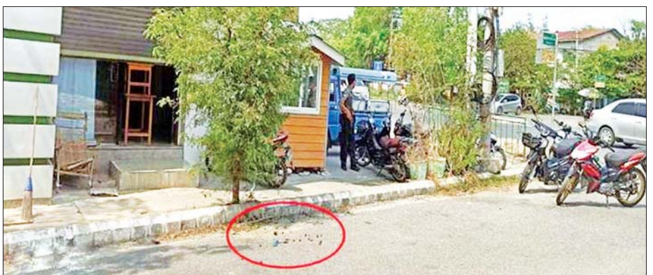
ပြည်ကြီးတံခွန်မြို့နယ်၌ UAB ဘဏ်ရှေ့၌ လက်လုပ်ပိုး တစ်လုံး ပေါက်ကွဲမှု။

ချမ်းအေးသာစံမြို့နယ် ပြည်ကြီးမျက်ရှင်ရပ်ကွက် ၆၅ လမ်း၊ ၃၃ လမ်းနှင့် ၃၄ လမ်းကြား၊ ပါရမီလမ်းသွယ်ရှိ တရားရုံးဝန်ထမ်း လိုင်းခန်း၌လည်းကောင်း အကြမ်းဖက်သောင်းကျန်းသူများက လက်လုပ်ပိုးများဖြင့် ပစ်ပေါက်ထွက်ပြေးသွားသဖြင့် ပေါက်ကွဲမှုများ ဖြစ်ပွားခဲ့ပြီး လူနှင့် အဆောက်အအုံ ထိခိုက်ပျက်စီးမှုရှိကြောင်းနှင့် လုံခြုံရေးတပ်ဖွဲ့ဝင်များက လိုအပ်သည့် စစ်ဆေးမှုများ ဆောင်ရွက်လျက်ရှိကြောင်း သိရသည်။ အလားတူ ဧပြီ ၂၉ ရက် ၂၄ နာရီ ၄၅ မိနစ်တွင် ပဲခူးတိုင်းဒေသကြီး တောင်ငူမြို့ (၁၉) ရပ်ကွက်ရှိ မြို့နယ်ပညာရေးမှူးရုံးကို အကြမ်းဖက်သူ အမျိုးသား သုံးဦးက ဆိုင်ကယ်နှစ်စီးဖြင့် ရောက်ရှိလာပြီး မီးပုလင်းဖြင့် ပစ်ပေါက်ထွက်ပြေးသွားခဲ့ပြီး ပစ်ပေါက်မှုကြောင့် ရုံးပြတင်းပေါက် တံခါးမှန်သုံးချပ် ကွဲအက်ပျက်စီးခဲ့ကာ မီးလောင်ကျွမ်းမှုရှိကြောင်း သိရသည်။ ထို့ပြင် ဧပြီ ၃၀ ရက် နံနက် ၇ နာရီတွင် မကွေးတိုင်းဒေသကြီး မကွေးမြို့နယ် အောင်စေတနာရပ်ကွက် တောင်တွင်းလမ်းနှင့် အဝေရာလမ်းထောင့်ရှိ လက်ဖက်ရည်ဆိုင်တွင် လက်လုပ်ပိုးတွေ့ရှိ