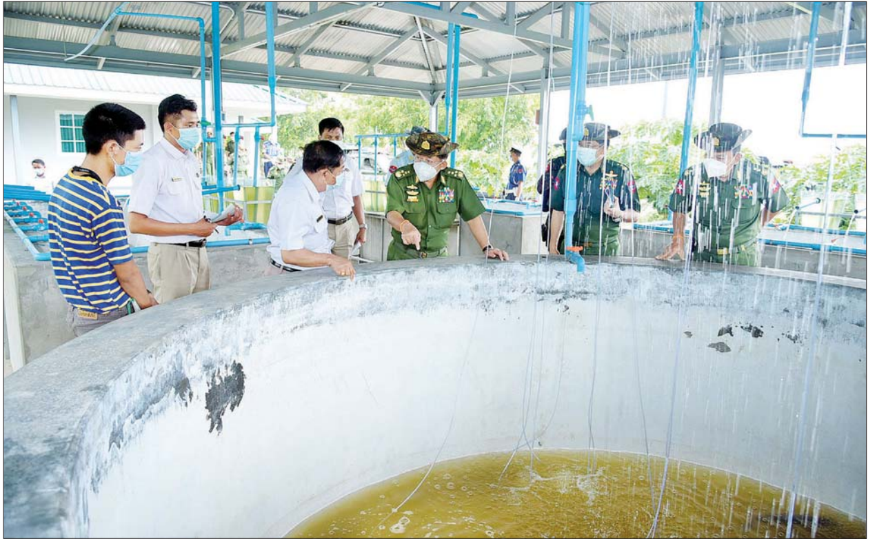
နိုင်ငံတော်စီမံအုပ်ချုပ်ရေးကောင်စီဥက္ကဋ္ဌ၊ တပ်မတော်ကာကွယ်ရေးဦးစီးချုပ် ဗိုလ်ချုပ်မှူးကြီး မင်းအောင်လှိုင် မွေးမြူရေးဇုန်အတွင်း ငါးသားဖောက်လုပ်ငန်း ဆောင်ရွက်နေမှုကို ကြည့်ရှုစစ်ဆေးစဉ်။

စိုက်ပျိုးရေးနှင့်ပတ်သက်၍ အဓိကစားကုန်ဖြစ်သည့် ဆန်များ အရည်အသွေးပြည့်မီရေးအတွက် အထွက်နှုန်းကောင်းမွန်၍ အရည်အသွေးပြည့်မီသည့် စပါးမျိုးများ စိုက်ပျိုးနိုင်ရေး မျိုးကောင်းမျိုးသန့်များ ရရှိအောင် သုတေသနပြု စိုက်ပျိုးရန်လို ကြောင်း၊ ပြည်တွင်း ဆန်လိုအပ်ချက်ကို ဖြည့်ဆည်းနိုင်ရုံသာမက ပြည်ပနိုင်ငံများသို့လည်း တင်ပို့နိုင်ရောင်းချနိုင်ရေး ဆောင်ရွက်ရမည်ဖြစ်ကြောင်း၊ စိုက်ပျိုးရေး