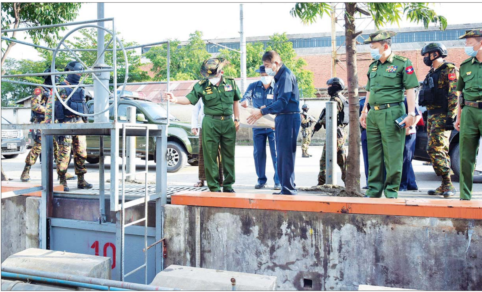
နိုင်ငံတော်စီမံအုပ်ချုပ်ရေးကောင်စီဥက္ကဋ္ဌ၊ တပ်မတော်ကာကွယ်ရေးဦးစီးချုပ် ဗိုလ်ချုပ်မှူးကြီး မင်းအောင်လှိုင် ကျောက်တံတားမြို့နယ် ဆူးလေဘုရားလမ်းနှင့် ကမ်းနား လမ်းထောင့်ရှိ အမှတ် ၁၀ ရေတံခါးအား ကြည့်ရှုစစ်ဆေးစဉ်။

နေပြည်တော် ဧပြီ ၃၀ နိုင်ငံတော် စီမံအုပ်ချုပ်ရေး ကောင်စီဥက္ကဋ္ဌ၊ တပ်မတော် ကာကွယ်ရေးဦးစီးချုပ် ဗိုလ်ချုပ် မှူးကြီး မင်းအောင်လှိုင်သည် ယနေ့မွန်လွဲပိုင်းတွင် နိုင်ငံတော် စီမံအုပ်ချုပ်ရေးကောင်စီဝင်များ ဖြစ်ကြသည့် ဗိုလ်ချုပ်ကြီး မောင်မောင်ကျော်၊ ဒုတိယ ဗိုလ်ချုပ်ကြီး မိုးမြင့်ထွန်း၊ ကောင်စီ တွဲဖက်အတွင်းရေးမှူး ဒုတိယဗိုလ်ချုပ်ကြီး ရဲဝင်းဦး၊ ကာကွယ်ရေးဦးစီးချုပ် (ရေ) ဗိုလ်ချုပ်ကြီး မိုးအောင်၊ ကာကွယ် ရေးဦးစီးချုပ်ရုံးမှ တပ်မတော် အရာရှိကြီးများ၊ ရန်ကုန်တိုင်း စစ်ဌာနချုပ်တိုင်းမှူး ဗိုလ်ချုပ် ညွန့်ဝင်းဆွေနှင့် တာဝန်ရှိသူများ နှင့်အတူ ရန်ကုန်တိုင်းဒေသကြီး သန်လျင်မြို့နယ်ရှိ လျှပ်စစ်နှင့် စွမ်းအင်ဝန်ကြီးဌာန၊ မြန်မာ့ရေနံ ဓာတုဗေဒလုပ်ငန်း၊ အမှတ်(၁) ရေနံချက်စက်ရုံ (သန်လျင်)သို့ သွားရောက်ကြည့်ရှု စစ်ဆေး သည်။ စာမျက်နှာ ၄ ကော်လံ ၁ ●