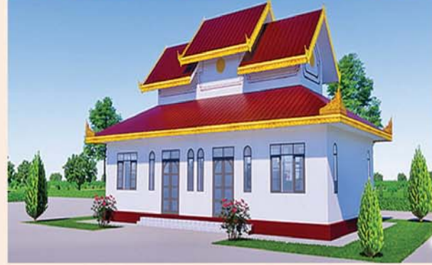
ဂေါပကဗုံ (၄၈x၂၄)ပေ ၁ လုံး-၄၂၃ သိန်း