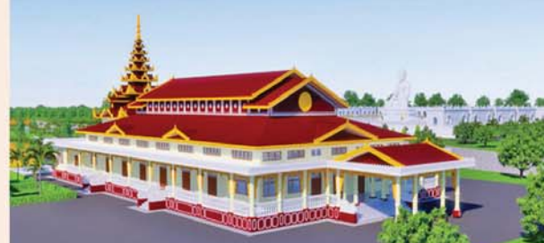
ဓမ္မာရုံ(၂၃၁x၉၀)ပေ ၁ လုံး-၈၇၃၀ သိန်း