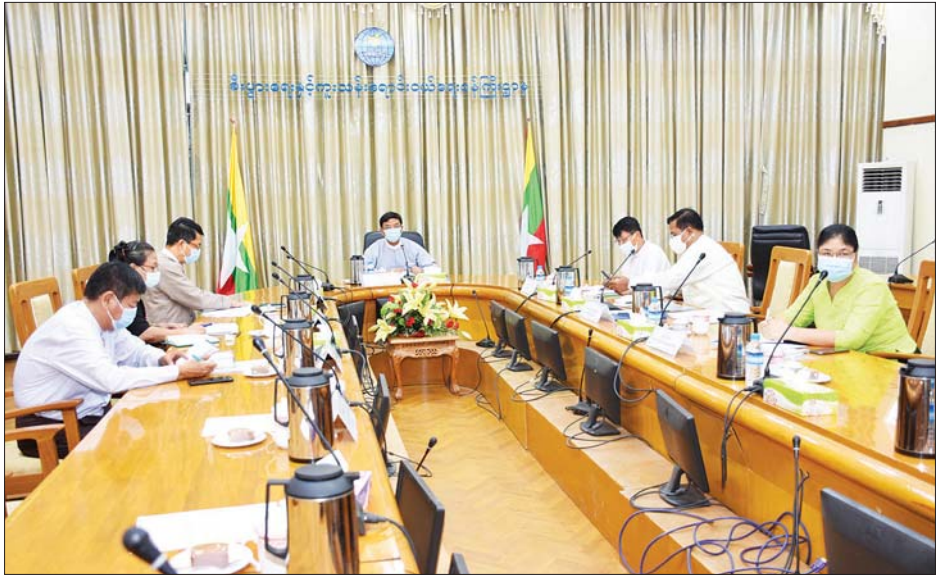
ဇွေစပါးစိုက်ပျိုးထွက်ရှိသည့် ဒေသများတွင် စပါးဈေး လေ့လာစောင့်ကြည့်၍ အခြေခံရည်ညွှန်း စပါး ဖြစ်ပေါ်မှု အခြေအနေများကို စဉ်ဆက်မပြတ် ဈေးနှုန်းဖြင့် ဝယ်ယူရန် လိုအပ်ပါက အဆင်သင့်

အစည်းအဝေးတွင် လယ်ယာထုတ်ကုန်စီမံ ခန့်ခွဲရေးအဖွဲ့ဥက္ကဋ္ဌ ဒုတိယဝန်ကြီး ဦးညွန့်အောင် က နိုင်ငံတော်စီမံအုပ်ချုပ်ရေးကောင်စီက တောင်သူ လယ်သမားအခွင့်အရေး ကာကွယ်ရေးနှင့် အကျိုး စီးပွားမြှင့်တင်ရေး ဦးဆောင်အဖွဲ့နှင့် လယ်ယာ ထုတ်ကုန်စီမံခန့်ခွဲရေးအဖွဲ့တို့ကို ပြင်ဆင်ဖွဲ့စည်းမှု၊ ယခုဘဏ္ဍာနှစ်အတွင်း အခြေခံရည်ညွှန်း စပါး ဈေးနှုန်းဖြင့် တောင်သူလယ်သမားများထံမှ စပါး ဝယ်ယူမှု၊ ဘင်္ဂလားဒေ့ရှ်နိုင်ငံသို့ ဆန်တန်ချိန် တစ်သိန်းကို G to G အစီအစဉ်ဖြင့် တင်ပို့နေမှု၊