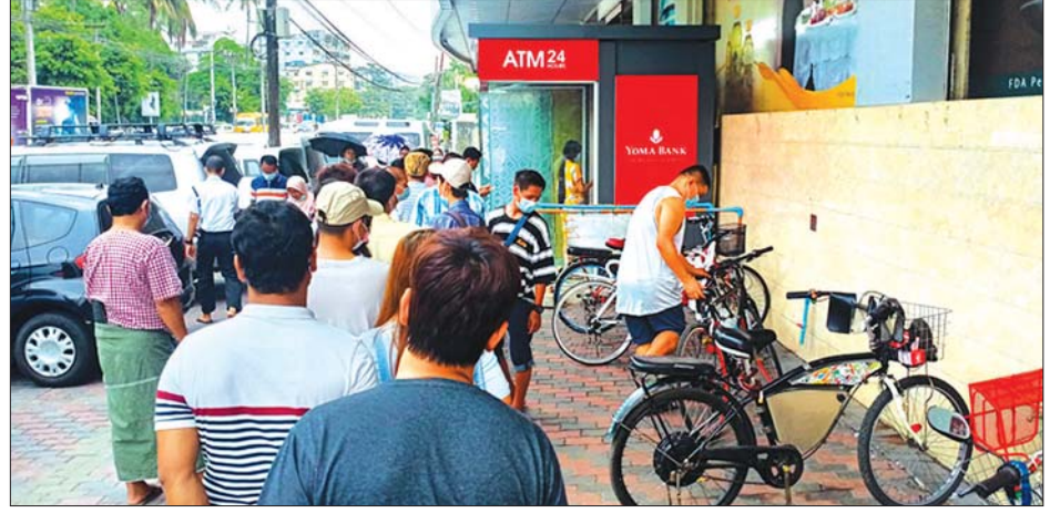
ရန်ကုန်မြို့ အရောင်းစင်တာတစ်ခုရှိ ATM စက်မှ ငွေထုတ်ရန် တန်းစီစောင့်ဆိုင်းနေသော သူများကို တွေ့ရစဉ်။

သည်။ နိုင်ငံတစ်ဝန်းနှင့် ရန်ကုန်မြို့ အပါအဝင် မြို့အနှံ့အပြားရှိ ပုဂ္ဂလိကဘဏ်များသည် ပြီးခဲ့ သော ဖေဖော်ဝါရီ ၈ ရက်ဝန်းကျင် မှစတင်ကာ ဘဏ်လုပ်ငန်းဆိုင်ရာ ဝန်ဆောင်မှု လုပ်ငန်းများကို ယာယီ ရပ်နားထားခဲ့သည်မှာ နှစ်လကျော် ကြာမြင့်ခဲ့သည်။