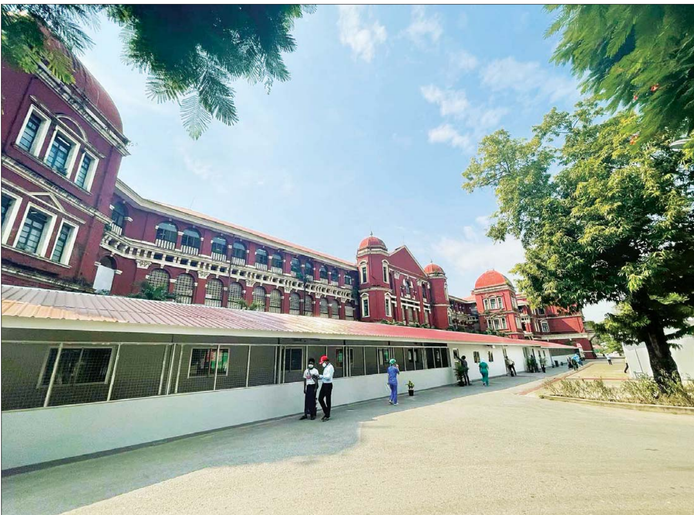
ရန်ကုန်ပြည်သူ့ဆေးရုံကြီး ပြန်လည်ဖွင့်လှစ်ထားမှုကို တွေ့ရစဉ်။

Coronavirus Disease 2019 (COVID-19) ရောဂါပိုး ကူးစက်ပျံ့နှံ့မှုကို ဆက်လက်ထိန်းချုပ်ဆောင်ရွက်ရန် လိုအပ်ပါသဖြင့် ပြည်ထောင်စုအဆင့်အဖွဲ့အစည်းများ၊ ပြည်ထောင်စုဝန်ကြီးဌာနများမှ Coronavirus Disease 2019 (COVID-19) ကာကွယ်၊ ထိန်းချုပ်၊ တားဆီးရေးအတွက် ၂၀၂၁ ခုနှစ်၊ ဧပြီလ ၃၀ ရက်နေ့အထိ ထုတ်ပြန်ထားသော ပြည်သူ့သို့ ပန်ကြားချက်၊ အမိန့်၊ အမိန့်ကြော်ငြာစာ၊ ညွှန်ကြားချက်များ (မြေလျှော့ပေးထားသည့် ကိစ္စရပ်များမပါ) အား ၂၀၂၁ ခုနှစ်၊ မေလ ၃၁ ရက်နေ့အထိ ရက်တိုးမြှင့် သတ်မှတ်ဆောင်ရွက်ထားပါကြောင်း အသိပေးကြေညာအပ်ပါသည်။