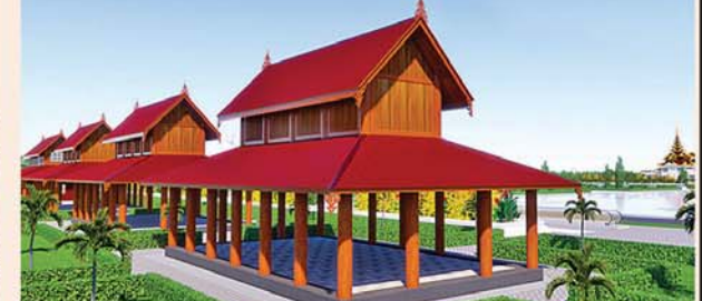
သုဓမ္မာဇရင်(၅၄x၃၀)ပေ ၆ လုံး ၁ လုံးလျှင်-၅၅၇၇ သိန်း

၁။ နိုင်ငံတော်စီမံအုပ်ချုပ်ရေးကောင်စီဥက္ကဋ္ဌ၊ တပ်မတော်ကာကွယ်ရေးဦးစီးချုပ် ဗိုလ်ချုပ်မှူးကြီးမင်းအောင်လှိုင် ဦးဆောင်သည့် (၇)ရက်သား၊ သမီး၊ တုရားဒါယကာ၊ ဒါယိကာမတို့က မာရဝိဇယပုဒ္ဓရုပ်ပွားတော်မြတ်ကြီးအား မြန်မာနိုင်ငံတွင် ထေရဝါဒ ဗုဒ္ဓသာသနာတော်ထွန်းလင်းတောက်ပလျက်ရှိသည်ကို ကမ္ဘာကိုပြသရန်၊ တိုင်းပြည်အေးချမ်းသာယာမှုရရှိစေရန်၊ ရုပ်ပွားတော်မြတ်ကြီးအား ပြည်တွင်း၊ ပြည်ပဘုရားဖူးများလာရောက်ခြင်းဖြင့် ဒေသတိုးတက်စည်ကားမှုကို အထောက်အကူဖြစ်စေရန်၊ နိုင်ငံတော် ဖွံ့ဖြိုးတိုးတက်မှု အထောက်အကူဖြစ်စေရန်ရည်သန်လျက် ပြည်ထောင်စုနယ်မြေ နေပြည်တော်၊ ဒက္ခိဏသီရိမြို့နယ်အတွင်း၌ သာသနာတော်ထုံး၊ ရုပ်ပွားဆင်းတုတော်ထုံး၊ မြန်မာ့ရိုးရာတည်ထုံးများနှင့်အညီ တည်ဆောက်ပူဇော်လျက်ရှိပါသည်။