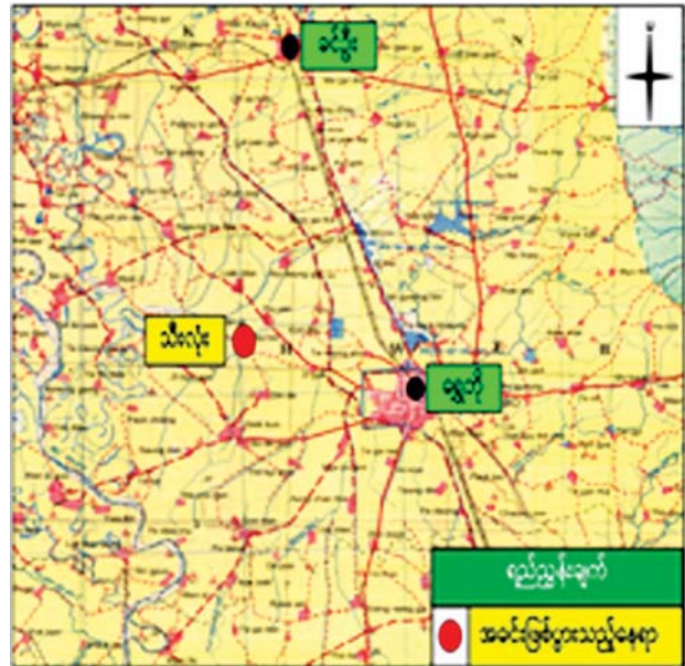
အခင်းဖြစ်ပွားသည့်နေရာပြမြေပုံ။ အရေးယူနိုင်ရေး လိုအပ်နေသည့် ရှေ့တွင် သတင်းရရှိသည်။ ဝင်များက ဆောင်ရွက်လျက် သတင်းစဉ်