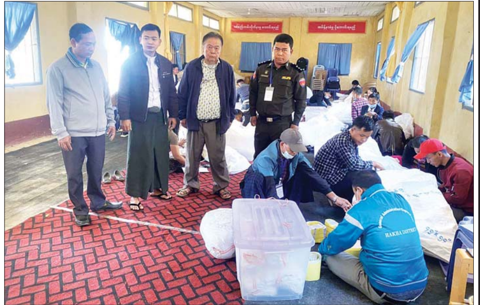
ထန်တလန်မြို့နယ် ဆန္ဒမဲလက်မှတ် မြေပြင်စစ်ဆေးမှု မှတ်တမ်းဓာတ်ပုံ။