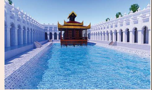
ပုတ်တလုတ်ကန်(၁၉၆x၁၁၆)ပေ ၁ ကန်-၈၂၄၀ သိန်း