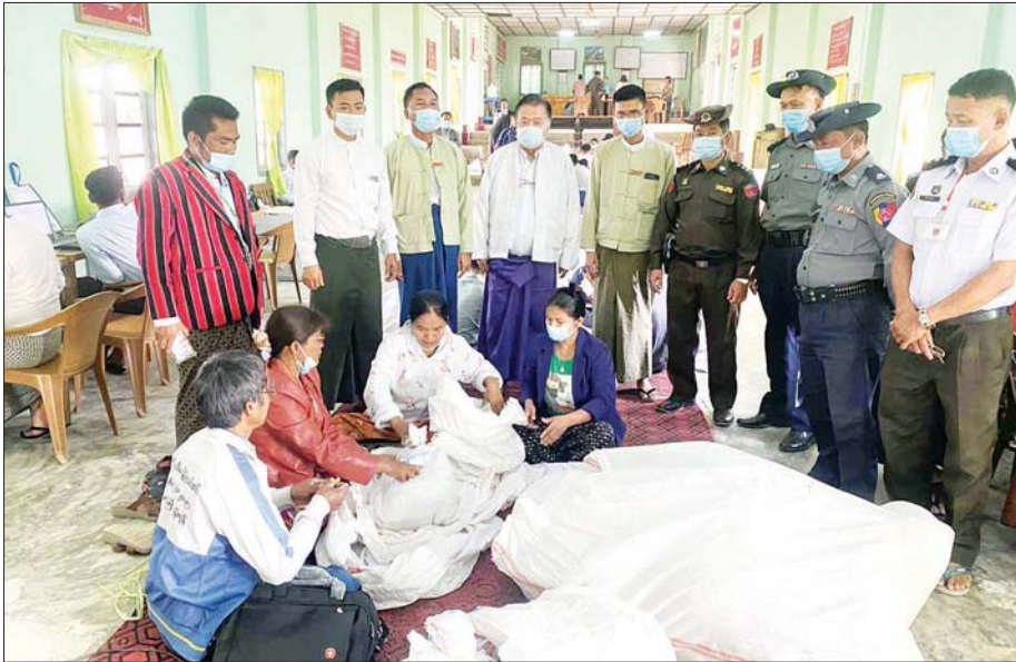
ကန်ပက်လက်မြို့နယ် ဆန္ဒမဲလက်မှတ် မြေပြင်စစ်ဆေးမှု မှတ်တမ်းဓာတ်ပုံ။