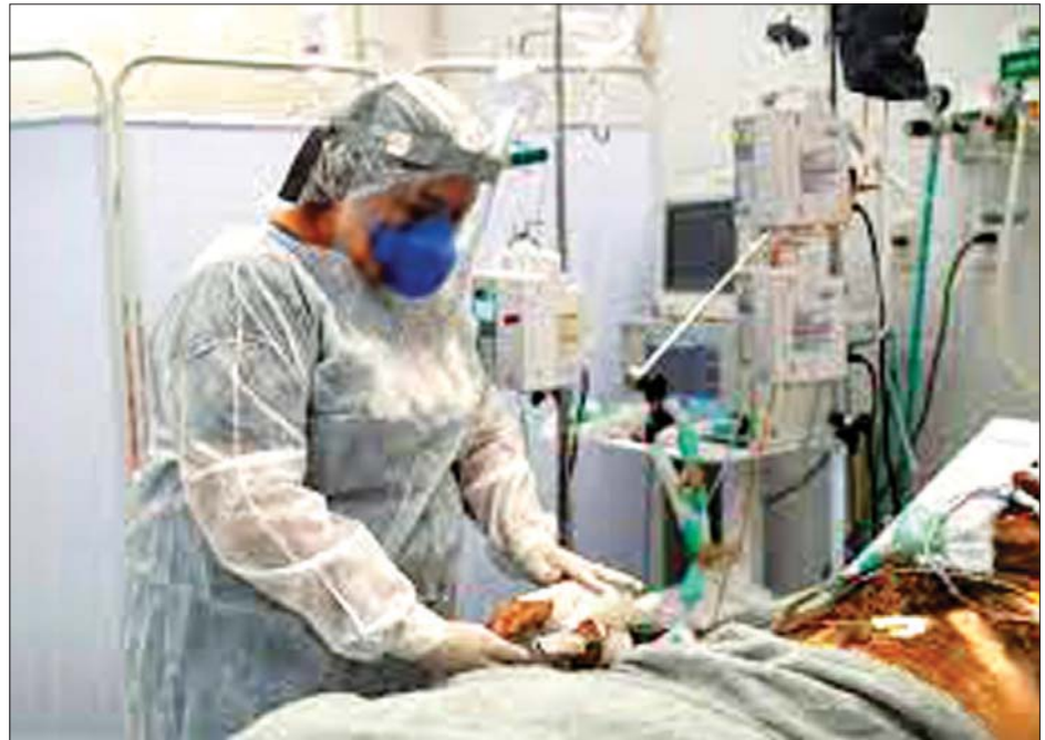
ဘရာဇီးနိုင်ငံ ဆေးရုံတစ်ရုံရှိ အထူးကြပ်မတ်ကုသဆောင်တွင် ကိုဗစ်လူနာတစ်ဦးကို ကုသပေးနေစဉ်။

ည ၈ နာရီမှ နံနက် ၅ နာရီအထိ ထုတ်ပြန်ထား သော ညမထွက်ရအမိန့်သည် ဒေသများကို နေအိမ်များတွင် နေထိုင်ရန် တိုက်တွန်းအားပေးထား သည်။ ယခုကဲ့သို့လုပ်ဆောင်ခြင်းသည် ဆေးရုံအထူး ကြပ်မတ် ကုသဆောင်ရှိ လူနာတင်ပြည့်ကြပ်မှုကို လျှော့ချရာတွင် အောင်မြင်မှု ရရှိစေကြောင်း ဆော်ပေါလို အုပ်ချုပ်ရေးမှူး ကျော်အာဒိုရီယာက ပြောကြားလိုက်သည်။ ဆင်ဟွာ