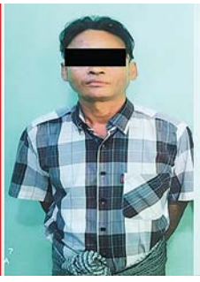
မြင့်ချို