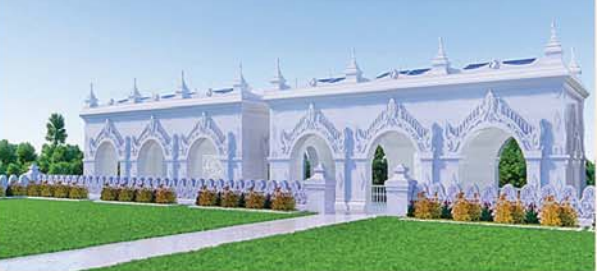
မြန်မာ့မူလကျောက်မြင့် တည်ဆောက်ပူဇော်ထားသော ဂန္ဓကုဋီတိုက် (၅၄x၂၇)ပေ ၂၄ လုံး ၁ လုံးလျှင်- ၁၂၅၀ သိန်း