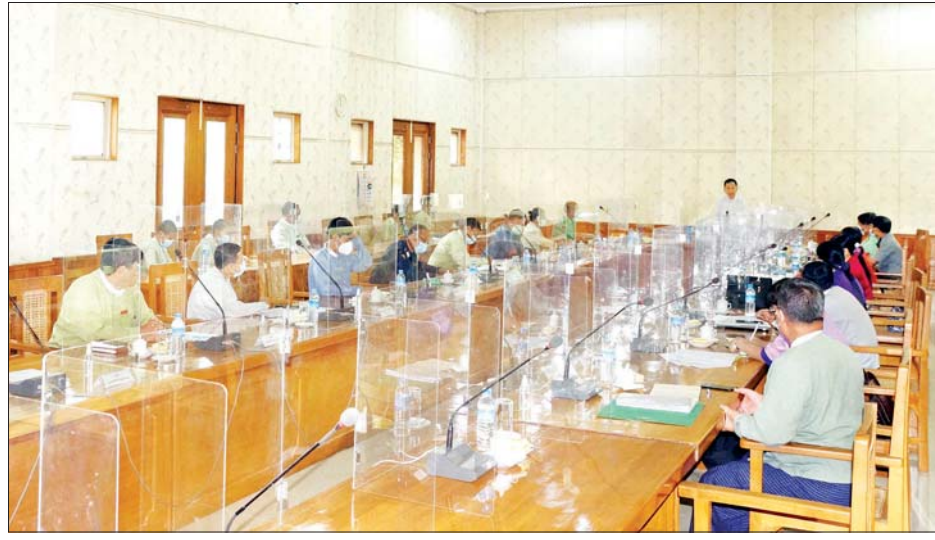
ဆိုင်ရာများက သက်ဆိုင်ရာကဏ္ဍများအလိုက်စီစဉ်ဆောင်ရွက်ထားရှိမှု အခြေအနေများကို ဆွေးနွေးတင်ပြကြရာ နေပြည်တော်ကောင်စီ COVID-19 ထိန်းချုပ်ရေးနှင့် အရေးပေါ်တုံ့ပြန်ရေးကော်မတီဥက္ကဋ္ဌ ဒေါက်တာမောင်မောင်နိုင်က လိုအပ်သည်များကို ဖြည့်စွက်ဆွေးနွေးခဲ့ကြောင်း သိရသည်။ ခရိုင်(ပြန်/ဆက်)

နေပြည်တော် ဧပြီ ၂၆ နေပြည်တော်ကောင်စီ COVID-19 ထိန်းချုပ်ရေးနှင့် အရေးပေါ်တုံ့ပြန်ရေးကော်မတီ လုပ်ငန်းညှိနှိုင်းအစည်းအဝေးကို ယနေ့နံနက် ၁၀ နာရီတွင် နေပြည်တော်ကောင်စီရုံးအစည်းအဝေးခန်းမ၌ ကျင်းပသည်။ (ယာဝုံ) ရေးဦးစွာ နေပြည်တော်ကောင်စီ COVID-19 ထိန်းချုပ်ရေးနှင့် အရေးပေါ်တုံ့ပြန်ရေးကော်မတီဥက္ကဋ္ဌ နေပြည်တော်ကောင်စီဥက္ကဋ္ဌ ဒေါက်တာမောင်မောင်နိုင်က အဖွင့်အမှာစကား ပြောကြားရာတွင် “နေပြည်တော်ကောင်စီ နယ်မြေအတွင်း COVID-19 ရောဂါတစ်ကျော့ပြန် မဖြစ်ပေါ်စေရေးအတွက် လိုအပ်သည်များကို ကြိုတင်စီစဉ်ဆောင်ရွက်ထားကြရန်လိုကြောင်း၊ လက်ရှိအချိန်တွင် အိမ်နီးချင်းနိုင်ငံများမှာ COVID-19 ရောဂါ ဖြစ်ပွားမှုမြင့်တက်လာသည်ကိုလည်း တွေ့နေရပါကြောင်း၊ ကာကွယ်ထိန်းချုပ်ကုသရေးလုပ်ငန်းများ ထိရောက်စွာ ဆောင်ရွက်နိုင်ရေးအတွက် ကြိုတင် ပြင်ဆင်ထားရှိရန်နှင့် Quarantine Centre များကိုလည်း လိုအပ်သည့်အချိန်မှာ အဆင်သင့်အသုံးပြု ဆောင်ရွက်နိုင်ရေးအတွက် စီစဉ်ဆောင်ရွက်ထားရှိရန် လိုအပ်ပါကြောင်း” ပြောကြားသည်။ ထို့နောက် နေပြည်တော်ကောင်စီ COVID-19 ထိန်းချုပ်ရေးနှင့် အရေးပေါ်တုံ့ပြန်ရေးကော်မတီအဖွဲ့ဝင် နေပြည်တော်ကောင်စီအဖွဲ့ဝင် ဗိုလ်မှူးကြီးမင်းနောင်က COVID-19 ရောဂါကာကွယ်ထိန်းချုပ်ကုသရေးလုပ်ငန်းများ ဆောင်ရွက်နေမှု အခြေအနေများနှင့် စီမံဆောင်ရွက်ထားမှု အခြေအနေများကို ရှင်းလင်းဆွေးနွေးတင်ပြသည်။ ယင်းနောက် တက်ရောက်လာကြသည့် နေပြည်တော်ကောင်စီ COVID-19 ထိန်းချုပ်ရေးနှင့် အရေးပေါ်တုံ့ပြန်ရေးကော်မတီအဖွဲ့ဝင်များနှင့် ဌာန