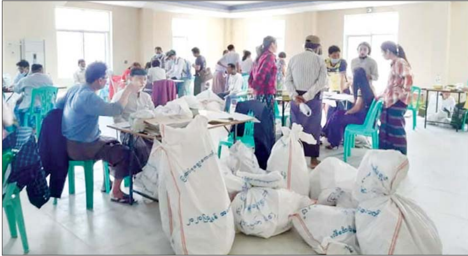
မံစီမြို့နယ် ဆန္ဒမဲလက်မှတ် မြေပြင်စစ်ဆေးမှုမှတ်တမ်း။