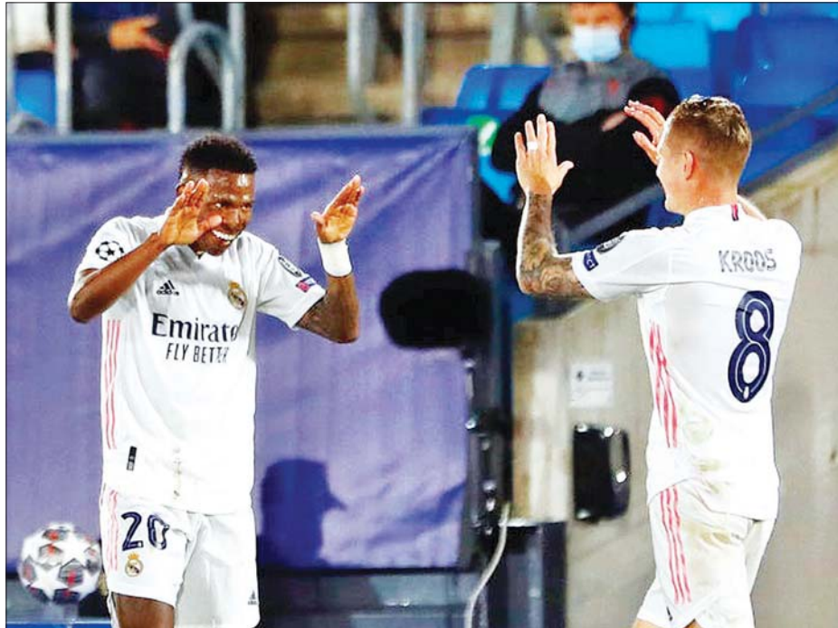
ရိုးရဲမက်ဒရစ် ကစားသမားများကို တွေ့ရစဉ်။

ယူအီးအက်ဖ်အေ ချန်ပီယံလိဂ်ဆီမီးဖိုင်နယ် ပထမအကျော့အဖြစ် စပိန်နာမည်ကြီး ရိုးရဲမက်ဒရစ်အသင်းနှင့် ပရီမီယာလိဂ်အသင်းကြီး ချယ်ဆီးအသင်းတို့ပွဲစဉ်ကို ဧပြီ ၂၈ ရက် နံနက်ပိုင်းတွင် ရိုးရဲမက်ဒရစ်အိမ်ကွင်း၌ ယှဉ်ပြိုင်ကစားမည် ဖြစ်သည်။