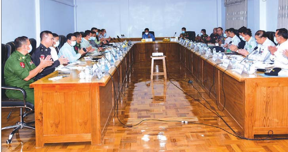
ရှမ်းပြည်နယ်စီမံအုပ်ချုပ်ရေးကောင်စီဥက္ကဋ္ဌ ရှမ်းပြည်နယ်အရှေ့ပိုင်းပြည်နယ် / ခရိုင်စီမံအုပ်ချုပ်ရေးအဖွဲ့များနှင့်တွေ့ဆုံ

ကျိုင်းတုံ ဧပြီ ၂၆ ရှမ်းပြည်နယ် စီမံအုပ်ချုပ်ရေးကောင်စီ ဥက္ကဋ္ဌ ဒေါက်တာကျော်ထွန်း၊ ကြိမ်ဒေသတိုင်းစစ်ဌာနချုပ်တိုင်းမှူး၊ ရှမ်းပြည်နယ် စီမံအုပ်ချုပ်ရေးကောင်စီအဖွဲ့ဝင်များ၊ ပြည်နယ်အဆင့်ဌာနဆိုင်ရာများနှင့်အတူ ယမန်နေ့က ကျိုင်းတုံမြို့ ခေမရရှိရိပ်သာ၌ ရှမ်းပြည်နယ် အရှေ့ပိုင်းပြည်နယ်/ ခရိုင် စီမံအုပ်ချုပ်ရေးအဖွဲ့များ၊ မြို့နယ်စီမံအုပ်ချုပ်ရေးအဖွဲ့များနှင့်တွေ့ဆုံသည်။