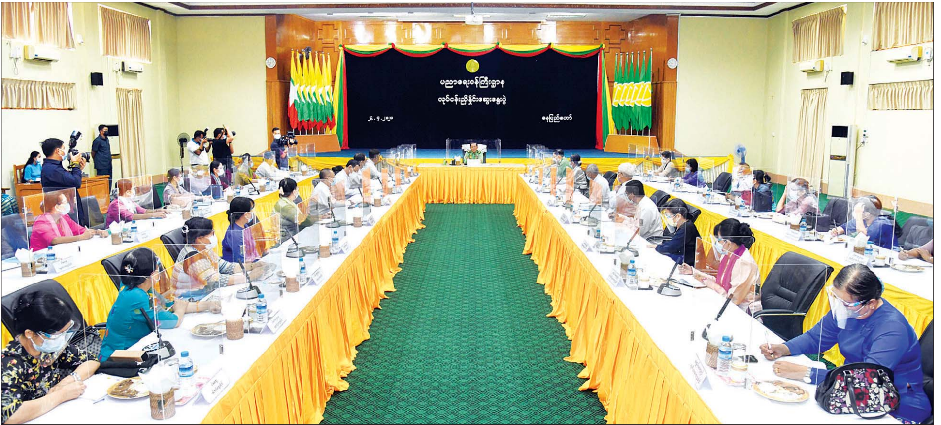
နိုင်ငံတော်စီမံအုပ်ချုပ်ရေးကောင်စီဥက္ကဋ္ဌ ၊ တပ်မတော်ကာကွယ်ရေးဦးစီးချုပ် ဗိုလ်ချုပ်မှူးကြီး မင်းအောင်လှိုင် တက္ကသိုလ်များတွင် စီးပွားရေးဘွဲ့သင်တန်းနှင့် ဥပဒေဘွဲ့သင်တန်းများ တိုးချဲ့ဖွင့်လှစ်ရေးလုပ်ငန်း ညှိနှိုင်းအစည်းအဝေးတွင် အမှာစကားပြောကြားစဉ်။