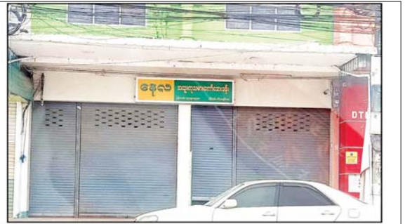
ဒေါက်တာ နေလင်းအောင်(အထူးကု၊ တာချီလိတ်ပြည်သူ့ဆေးရုံကြီး) ဆေးကုသနေသည့် "နေလ"အထူးကုဆေးခန်း မှတ်တမ်းဓာတ်ပုံ