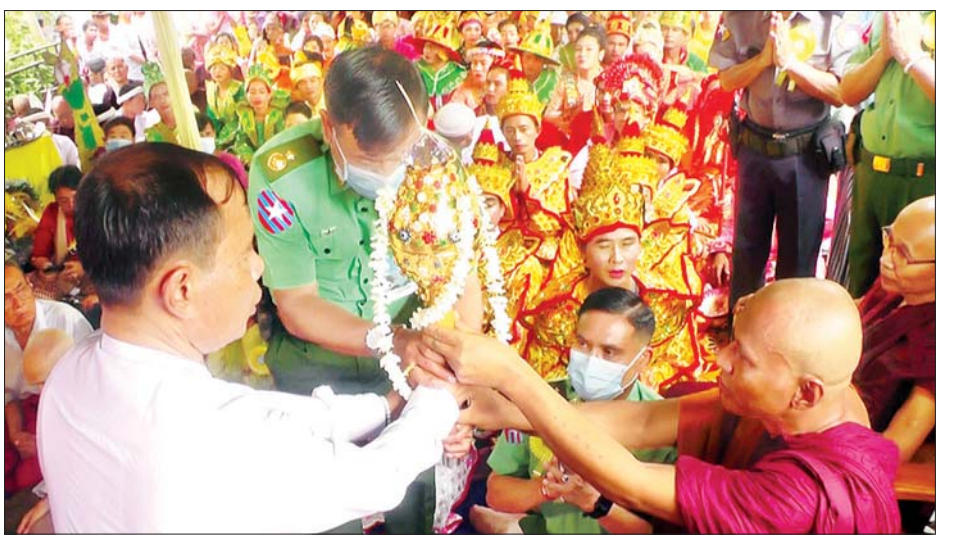
ပူဇော်ပြီး အမွှေးနံ့သာရည်များ ပက်ဖျန်းကာ များကို ရွတ်ဖတ်ပူဇော်ခဲ့ကြကြောင်း သတင်းရရှိ ဖေ့ဘွတ်စ်ပေါ်ဖော်ပြထားသောပုံရိပ်အရ သတင်းစဉ်