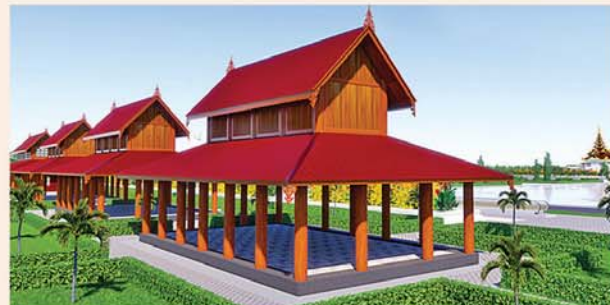
သုဓမ္မာဇရပ်(၅၄x၃၀)ပေ ၆ လုံး ဝ လုံးလျှင်-၅၅၇ သိန်း

၁။ နိုင်ငံတော်စီမံအုပ်ချုပ်ရေးကောင်စီဥက္ကဋ္ဌ၊ တပ်မတော်ကာကွယ်ရေးဦးစီးချုပ် ဗိုလ်ချုပ်မှူးကြီးမင်းအောင်လှိုင် ဦးဆောင်သည့် (၇)ရက်သား၊ သမီး၊ ဘုရားဒါယကာ၊ ဒါယိကာမတို့က မာရဝိဇယပုဒ္ဓရုပ်ပွားတော်မြတ်ကြီးအား မြန်မာနိုင်ငံတွင် ထေရဝါဒ ဗုဒ္ဓသာသနာတော်ထွန်းလင်းတောက်ပလျက်ရှိသည်ကို ကမ္ဘာကိုပြသရန်၊ တိုင်းပြည်အေးချမ်းသာယာမှုရရှိစေရန်၊ ရုပ်ပွားတော်မြတ်ကြီးအား ပြည်တွင်း၊ ပြည်ပဘုရားဖူးများလာရောက်ခြင်းဖြင့် ဒေသတိုးတက်စည်ကားမှုကို အထောက်အကူဖြစ်စေရန်၊ နိုင်ငံတော် ဖွံ့ဖြိုးတိုးတက်မှု အထောက်အကူဖြစ်စေရန်ရည်သန်လျက် ပြည်ထောင်စုနယ်မြေ နေပြည်တော်၊ ဒဂုံ၊ ကသာ၊ သီရိမြို့နယ်အတွင်း၌ သာသနာတော်ထုံး၊ ရုပ်ပွားဆင်းတုတော်ထုံး၊ မြန်မာ့ရိုးရာတည်ထုံးများနှင့်အညီ တည်ဆောက်ပူဇော်လျက်ရှိပါသည်။