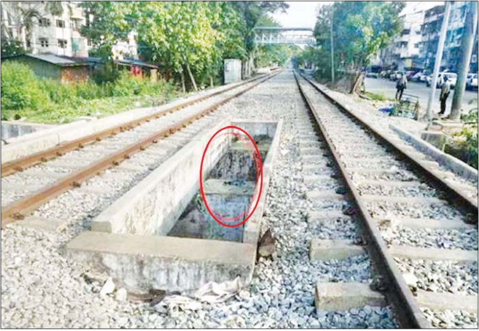
လှိုင်မြို့နယ်ရှိ ရထားသံလမ်းကြား၌ လက်လုပ်ပုံးတစ်လုံး ပေါက်ကွဲမှုဖြစ်ပွားခဲ့သည်ကို တွေ့ရစဉ်။

ထိုသို့ လုပ်ဆောင်ရာတွင် ၂၀၂၁ ခုနှစ် ဧပြီလ ၂၅ ရက်နေ့ နံနက် ၅ နာရီ ၁၅ မိနစ်တွင် တနင်္သာရီတိုင်းဒေသကြီး ရေးမြို့နယ် ရန်မျိုးအောင်ရပ်ကွက်ရှိ မြို့နယ်ပညာရေးမှူးရုံး ရုံးရှေ့သို့ ဆူပူအကြမ်းဖက်သူက အသံပုံးဖြင့် ပစ်ခတ်ခဲ့ရာ ပညာရေးမှူးရုံး မျက်နှာစာရှိ လေကာမှန် ၆ ချပ်ကွဲအက်ပျက်စီးနေသည်ကို တွေ့ရှိရပြီး ပေါက်ကွဲမှုကြောင့် လူထိခိုက်ဒဏ်ရာရမှု မရှိကြောင်း သိရသည်။