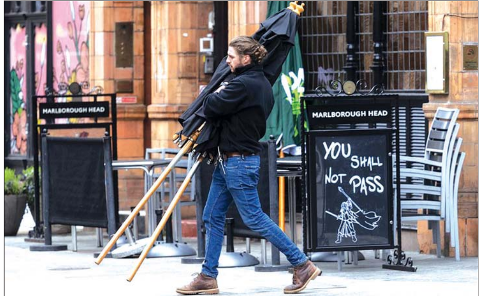
လန်ဒန်တွင် ဆိုင်ဖွင့်ရန် ပြင်ဆင်နေသူတစ်ဦးကို ဧပြီ ၁၂ ရက်က တွေ့ရစဉ်။