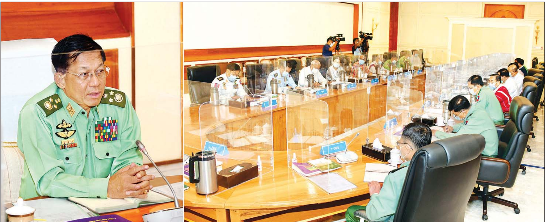
နိုင်ငံတော်စီမံအုပ်ချုပ်ရေးကောင်စီဥက္ကဋ္ဌ တပ်မတော်ကာကွယ်ရေးဦးစီးချုပ် ဗိုလ်ချုပ်မှူးကြီး မင်းအောင်လှိုင် နိုင်ငံတော်စီမံအုပ်ချုပ်ရေးကောင်စီအစည်းအဝေး (၉/၂၀၂၁)တွင် အမှာစကားပြောကြားစဉ်။ သတင်းစဉ်