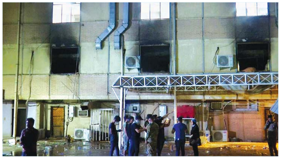
မီးလောင်ထားသည့် ဆေးရုံကို တွေ့ရစဉ်။