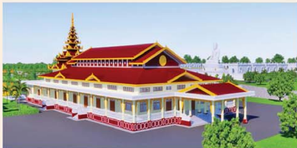
ဓမ္မာရုံ(၂၁၃x၉၀)ပေ ဝ လုံး-၈၇၀၀ သိန်း