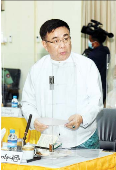
ပြည်ထောင်စုဝန်ကြီး ဒေါက်တာ ညွန့်ဖေ ရှင်းလင်းတင်ပြစဉ်။

အထောက်အကူပြုမည်ဖြစ်ကြောင်း၊ တက္ကသိုလ်ပညာသင်ကြားရေးနှင့်ပတ်သက်၍ အနာဂတ်ကို မျှော်တွေးပြီး စဉ်းစားဆောင်ရွက်ကြရန် လိုကြောင်း။