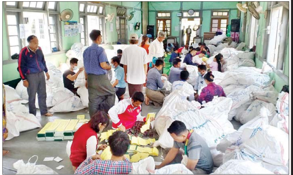
မိုးကောင်းမြို့နယ် ဆန္ဒမဲလက်မှတ် မြေပြင်စစ်ဆေးမှုမှတ်တမ်း။