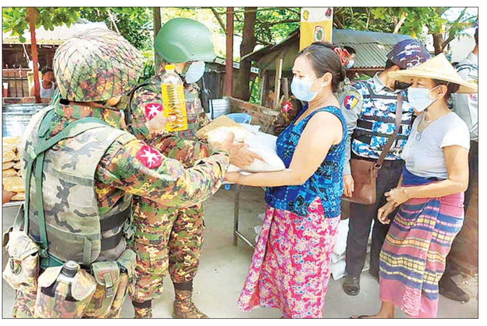
သတင်းစဉ်

အိမ်ထောင်စု စုစုပေါင်း ၁၀၆၀၀ တို့အတွက် ဆန်၊ ဆီ၊ ပဲများကို ရန်ကုန်တိုင်းစစ်ဌာနချုပ်၊ တပ်နယ် အသီးသီးမှ နယ်မြေခံတပ်မတော်သားများက ပြည်သူ များ၏ လက်ဝယ်အရောက် သွားရောက်ထောက်ပံ့ ပေးအပ်ခဲ့ကြသည်။ အလားတူ မန္တလေးမြို့၊ ချမ်းမြသာစည်မြို့နယ် အောင်သာယာရပ်ကွက် အကွက်အမှတ်(၈၈-၃၅/ ၃၆/၃၇/ ၃၈)ရှိ အိမ်ထောင်စု စုစုပေါင်း ၅၀၀ စုတို့ အတွက်ဆန်နှင့်စားသောက်ဖွယ်ရာများကို အလယ်ပိုင်း တိုင်းစစ်ဌာနချုပ်ရှိ နယ်မြေခံတပ်မတော်သားများ က ပြည်သူများ၏ လက်ဝယ်အရောက် သွားရောက် ထောက်ပံ့ပေးအပ်ခဲ့ကြောင်း သတင်းရရှိသည်။