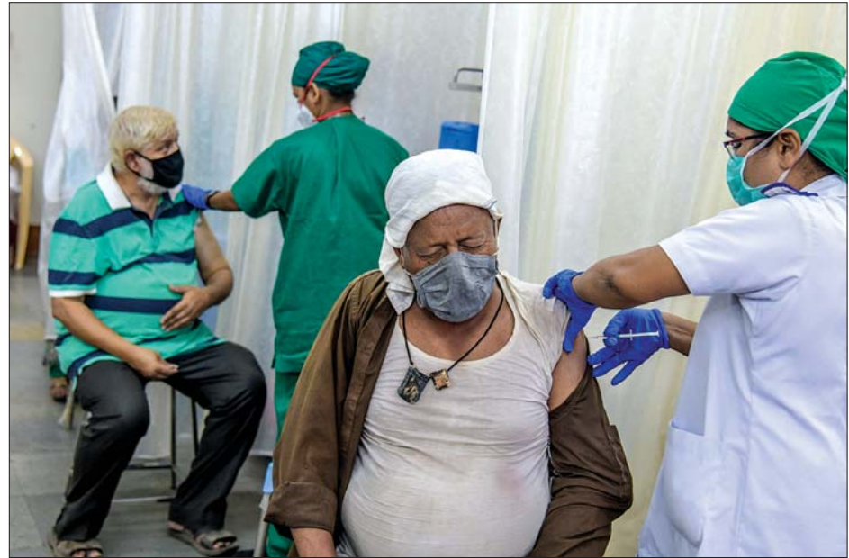
မွမ်ဘိုင်းရှိ ကိုဗစ်-၁၉ ကာကွယ်ဆေးထိုးစင်တာတွင် ကာကွယ်ဆေးထိုးပေးနေသည်ကို တွေ့ရစဉ်။

ချီလီနိုင်ငံတွင်မူ ကိုဗစ်-၁၉ ကူးစက်မှုပြန်လည်မြင့်မားလာခြင်း နှင့်ကြုံတွေ့နေရသည်။ ကိုဗစ်-၁၉ ကာကွယ်ဆေးမထိုးရသေးသည့်သူ များကြား သွားလာလှုပ်ရှားမှုများ များပြားသည့်အတွက် ကူးစက်မှု ထပ်မံပေါ်ပေါက်လာခြင်းဖြစ်သည်ဟု ကျွမ်းကျင်သူများက ယူဆ ကြသည်။ ကျယ်ကျယ်ပြန့်ပြန့် ကာကွယ်ဆေးထိုးပြီး လူထုကြားထဲ တွင် ကိုယ်ခံအား မတည့်ဆောက်နိုင်သေးသရွေ့ ပြည်သူများကြား သတိထားမှုများကို မလျော့သေးသင့်ကြောင်းလည်း သတိပေးထား သည်။ အင်န်အိတ်ချ်ကေ