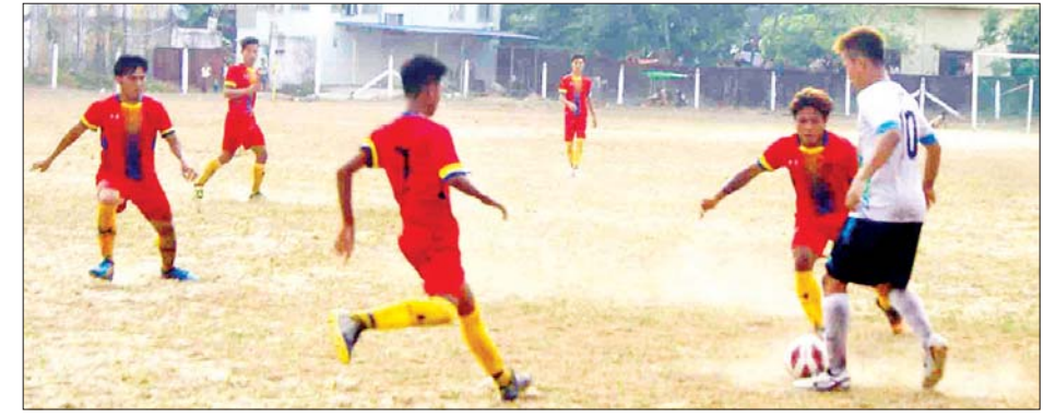
အောင်မြို့နယ် ဘောလုံးအသင်းနှင့် အမ်းမြို့နယ် ဘောလုံးအသင်းတို့ ယှဉ်ပြိုင်ကစားကြ ဧပြီ ၂၆ ရက်တွင် ကျင်းပမည် သည်။ ဗိုလ်လုပွဲနှင့် ဆုပေးပွဲကို ဖြစ်ကြောင်း ခရိုင်အားကစားနှင့်

ကျောက်ဖြူခရိုင်အတွင်းရှိ မြို့နယ်များဖြစ်သော ကျောက်ဖြူမြို့နယ်၊ မာန်အောင်မြို့နယ်၊ အမ်းမြို့နယ်နှင့် ရမ်းဗြဲမြို့နယ်စသည့် လေးမြို့နယ်မှ ဘောလုံးအသင်း လေးသင်းတို့ ပါဝင်ယှဉ်ပြိုင်ကြမည်ဖြစ်ပြီး ပထမပွဲစဉ်အဖြစ် နံနက် ၈ နာရီတွင် ကျောက်ဖြူမြို့နယ် ဘောလုံးအသင်းနှင့် ရမ်းဗြဲမြို့နယ် ဘောလုံးအသင်း၊ ဒုတိယပွဲစဉ်အဖြစ် ညနေ ၄ နာရီတွင် မာန်