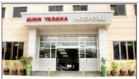
ဒေါက်တာ ကျော်လင်း(အထူးကု၊ ရန်ကုန်ကလေးဆေးရုံကြီး)အား ဆေးကုသခွင့်ပေးထားသည့် "အောင်ရတနာ" ဆေးရုံမှတ်တမ်းဓာတ်ပုံ