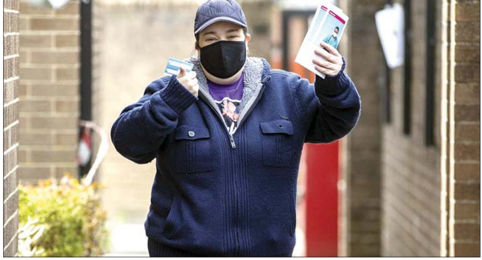
ကာကွယ်ဆေးထိုးပြီးပြန်လာသည့် ပြည်သူတစ်ဦးကို တွေ့ရစဉ်။

ဗဟိုအစိုးရသည် အောက်ဆီ ဂျင် တိုးမြှင့်ထုတ်လုပ်နိုင်ရေး အတွက်ဆောင်ရွက်လျက်ရှိသည်။ သို့သော်လည်း အောက်ဆီဂျင်လို အပ်ချက်မှာ များပြားလာသည့် အတွက် ထောက်ပံ့ပေးမှုမှာ အလျဉ်မမီနိုင်အောင် ဖြစ်ရသည် ဟု သိရသည်။ ဆင်ဟွာ