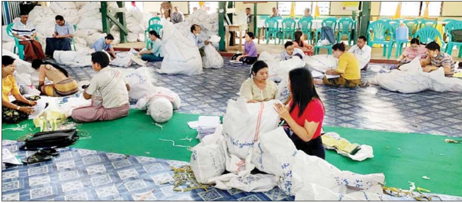
ညောင်ဦးမြို့နယ် ဆန္ဒမဲလက်မှတ်မြေပြင်စစ်ဆေးမှု မှတ်တမ်းဓာတ်ပုံ။