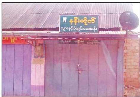
ဒေါက်တာ စိုးသန်းထိုက်(တန့်ယန်းမြို့နယ်ပြည်သူ့ဆေးရုံ)ဆေးကုသနေသည့် "နန်းထိုက်" ဆေးခန်းမှတ်တမ်းဓာတ်ပုံ