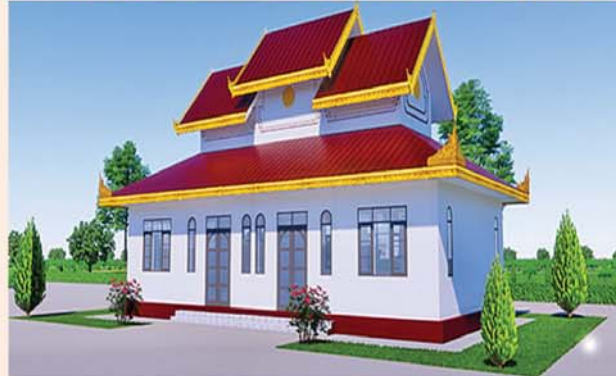
ဂေါပကဌ (၄၈x၂၄)ပေ ၁ လုံး-၄၂၃ သိန်း