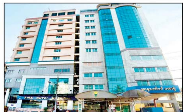
ဒေါက်တာ သန့်ဇော်(အထူးကု၊ ရန်ကုန်အရှေ့ပိုင်းခရိုင်ဆေးရုံကြီး)အား ဆေးကုသခွင့်ပေးထားသည့် "အာရှတော်ဝင်" ဆေးရုံမှတ်တမ်းဓာတ်ပုံ