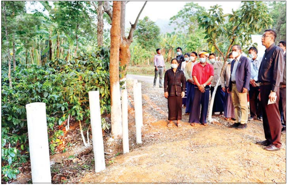
ပြည်ထောင်စုဝန်ကြီး ဦးတင်ထွဋ်ဦး Green Gold ကော်ဖီစိုက်ပျိုးရေးနှင့် အထွေထွေလုပ်ငန်း သမဝါယမအသင်းလီမိတက် အသင်းသားတောင်သူများ စိုက်ပျိုးထားသည့် ကော်ဖီစိုက်ခင်းများကို ကြည့်ရှုအားပေးစဉ်။

ရှမ်းပြည်နယ်အနေဖြင့် ဆန်ဖူလုံမှု ၈၈ ရာခိုင်နှုန်း၊ စားသုံးဆီဖူလုံမှု ၆၆ ရာခိုင်နှုန်းနှင့် ပဲမျိုးစုံဖူလုံမှု ၂၀၀ ရာခိုင်နှုန်းကျော်ရှိရာ ဒေသ၏ စားနပ်ရိက္ခာ ဖူလုံပိုလျှံရေး၊ ရေမြေရာသီဥတုနှင့် ကိုက်ညီသည့် ဝင်ငွေရ အရည်အသွေးကောင်း သီးနှံအမယ်သစ်များ ပြောင်းလဲစိုက်ပျိုးနိုင်ရေး၊ ခေတ်မီနည်းပညာများ အသုံးပြုနိုင်ရေးနှင့် သမဝါယမအသင်းများ ဖွဲ့စည်းဆောင်ရွက် နိုင်ရေးတို့အတွက် ပြည်ထောင်စုအဆင့် တာဝန်ရှိသူများနှင့် ဒေသအာဏာပိုင်များ အကြား ဆက်စပ်မှုအားကောင်းစွာဖြင့် ကြိုးပမ်းအကောင်