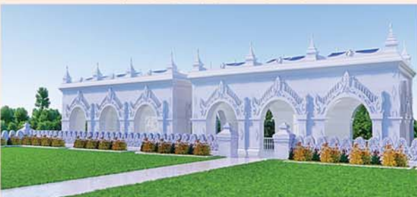
မြန်မာ့မူဝါဒကျောက်မြင့် တည်ဆောက်ပူဇော်ထားသော ဂန္ဓကုဋီတိုက် (၅၄x၂၇)ပေ ၂၄ လုံး ၁ လုံးလျှင်- ၁၂၅၀ သိန်း