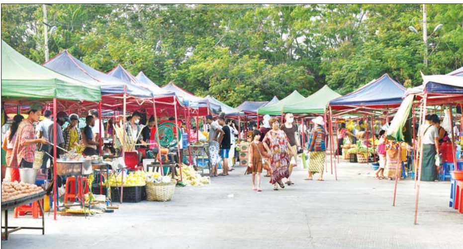
နေပြည်တော်ကောင်စီနယ်မြေရှိ သပြေကုန်းညဈေး ပြန်လည်ဖွင့်လှစ်ထားရှိမှုကို တွေ့ရစဉ်။

နေပြည်တော်ကောင်စီနယ်မြေအတွင်း မြို့မဈေး၊ သပြေကုန်းဈေး၊ အာဟာရသုခဈေး၊ ဒက္ခိဏသီရိဈေးနှင့် ပုဗ္ဗသီရိဈေးတို့ရှိ ညဈေးတန်းများအား ကိုဗစ် - ၁၉ ရောဂါဖြစ်ပွားမှုကြောင့် ၂၀၂၀ ပြည့်နှစ် စက်တင်ဘာ ၃၀ ရက်မှ စတင်ပိတ်ထားခဲ့ရာ ယခု ၂၀၂၁ ခုနှစ် ဧပြီ ၁၉ ရက်တွင် ပြန်လည်ဖွင့်လှစ်ခဲ့ပြီး ဈေးရောင်း၊ ဈေးဝယ်များဖြင့် ပြန်လည်စည်ကားလျက်ရှိသည်ကို တွေ့ရှိရသည်။