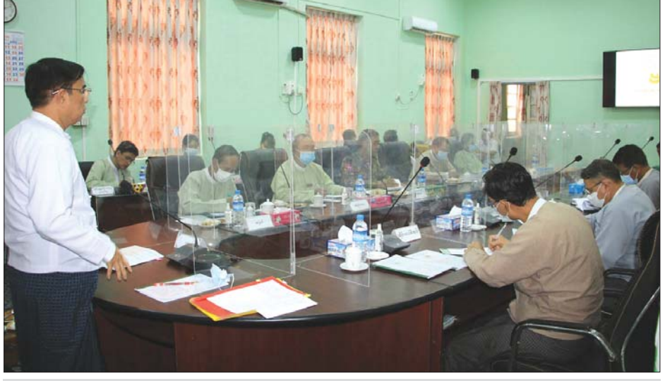
တိုင်းဒေသကြီး စီမံအုပ်ချုပ်ရေးကောင်စီ ဥက္ကဋ္ဌ ဦးမျိုးဆွေဝင်း အမှာစကားပြောကြားစဉ်။

သက်ရှိကမ္ဘာ ရှင်သန်ဖို့ အိုဇုန်းလွှာကို ထိန်းသိမ်းစို့