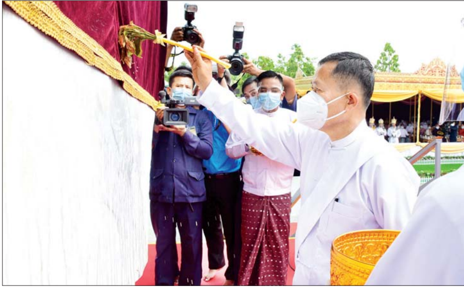
နိုင်ငံတော်စီမံအုပ်ချုပ်ရေးကောင်စီဒုတိယဥက္ကဋ္ဌ ဒုတိယတပ်မတော်ကာကွယ်ရေးဦးစီးချုပ် ကာကွယ်ရေး ဦးစီးချုပ် (ကြည်း) ဒုတိယဗိုလ်ချုပ်မှူးကြီး စိုးဝင်း “မာရဝိဇယ” ရုပ်ပွားတော်မြတ်ကြီး၏ ဆင်းတုတော် အပိုင်းများကို ပရိတ်နံ့သာရည်ဖြင့် ပက်ဖျန်းပူဇော်စဉ်။ သတင်းစဉ်

ဆက်လက်၍ ရတနာအုတ်မြစ်တော်စီသွင်း ပူဇော်ရန်အတွက် ရေးထုံးစဉ်လာ ကျမ်းဂန်တော်လာ အစဉ်အလာမြတ်များနှင့်အညီ နေရာယူကြပြီး ကောင်စီ ဒုတိယဥက္ကဋ္ဌ ဒုတိယတပ်မတော်ကာကွယ် ရေးဦးစီးချုပ် ကာကွယ်ရေးဦးစီးချုပ် (ကြည်း) က ပုလဲရတနာအုတ်မြစ်တော်ကို လည်းကောင်း၊ ဗိုလ်ချုပ်ကြီး မြထွန်းဦးက နီလာရတနာအုတ်မြစ် တော်ကိုလည်းကောင်း၊ ဗိုလ်ချုပ်ကြီး တင်အောင်စန်း က ဂေါ်မှတ်ရတနာ အုတ်မြစ်တော်ကိုလည်းကောင်း၊ ဗိုလ်ချုပ်ကြီး မောင်မောင်ကျော်က မြရတနာ အုတ်မြစ်တော်ကိုလည်းကောင်း၊ ဒုတိယဗိုလ်ချုပ်ကြီး အောင်လင်းဌေးက သန္တာရတနာအုတ်မြစ်တော်ကို လည်းကောင်း၊ ဦးဝင်းရှိန်က ကြောင်မျက်ရတနာ အုတ်မြစ်တော်ကိုလည်းကောင်း၊ ဒုတိယဗိုလ်ချုပ်ကြီး ကျော်စွာလင်းက ဥဿဖရားရတနာအုတ်မြစ်တော် ကိုလည်းကောင်း၊ ဒုတိယဗိုလ်ချုပ်ကြီး ကံမြင့်သန်း က စိန်ရတနာ အုတ်မြစ်တော်ကို လည်းကောင်း အသီးသီးစီသွင်းပူဇော်၍ ပရိတ်နံ့သာရည်များ ပက်ဖျန်းပူဇော်ကာ အုတ်မြစ်တော်ဗဟိုဌာနတွင် ကျောက်မျက်ရတနာမျိုးစုံကို ကြဖြန့်ပူဇော်ကြသည်။ ထို့နောက် သံဃာတော်အရှင်သူမြတ်များ ဦးဆောင်၍ “ဇယန္တော ဗောဓိယာ မူလေ” အစချီသည့် ဇယမင်္ဂလာ အောင်ဂါထာတော်များကို ရွတ်ဆိုပူဇော်ကြသည်။ ယင်းနောက် ဗုဒ္ဓသာသနံစိရိတိဋ္ဌတု သုံးကြိမ်ရွတ်ဆို ဆုတောင်း၍ အခမ်းအနားကို ရုပ်သိမ်းကာ ရတနာ