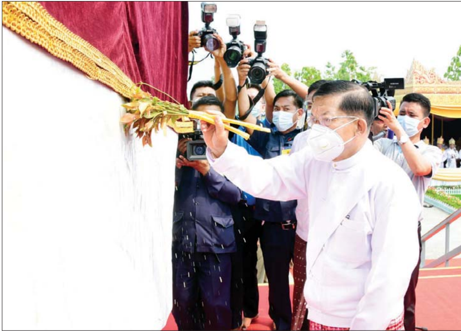
နိုင်ငံတော်စီမံအုပ်ချုပ်ရေးကောင်စီဥက္ကဋ္ဌ တပ်မတော်ကာကွယ်ရေးဦးစီးချုပ် ဗိုလ်ချုပ်မှူးကြီး မင်းအောင်လှိုင် “မာရဝိဇယ” ရုပ်ပွားတော်မြတ်ကြီး၏ ဆင်းတုတော်အပိုင်းများကို ပရိတ်နံ့သာရည်ဖြင့် ပက်ဖျန်းပူဇော်စဉ်။ သတင်းစဉ်