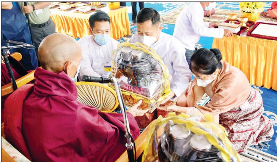
နိုင်ငံတော်စီမံအုပ်ချုပ်ရေးကောင်စီဥက္ကဋ္ဌ ဒုတိယတပ်မတော်ကာကွယ်ရေးဦးစီးချုပ် ကာကွယ်ရေးဦးစီးချုပ် (ကြည်း) ဒုတိယဗိုလ်ချုပ်မှူးကြီး စိုးဝင်း ပုလဲရတနာအုတ်မြစ်တော်ကို စီသွင်းပူဇော်စဉ်။ သတင်းစဉ်