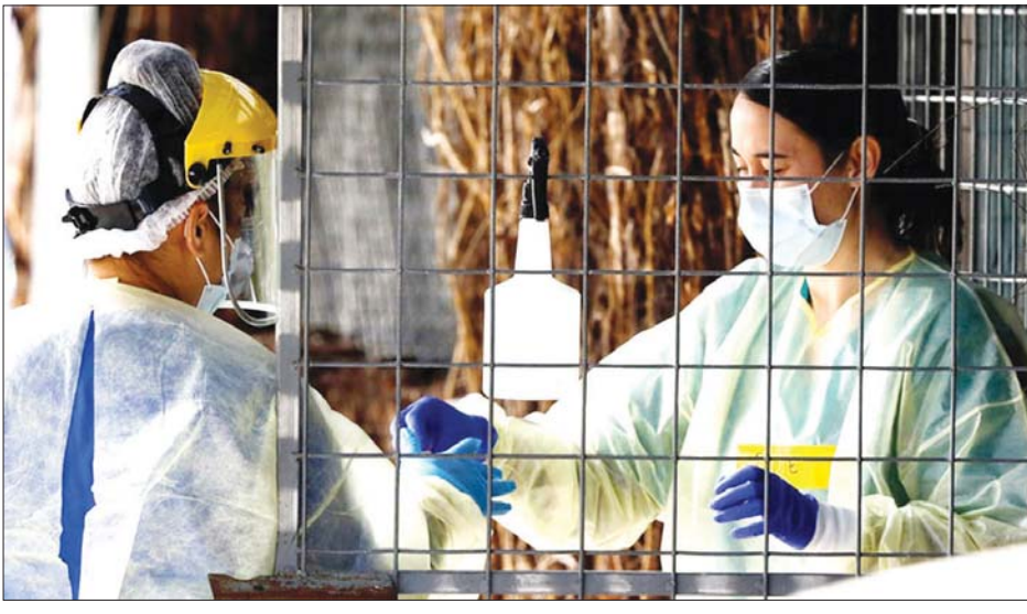
နယူးဇီလန်တွင် ကိုဗစ် -၁၉ ဆေးစစ်မှုပြုလုပ်ရန် ပြင်ဆင်နေသည့် ကျန်းမာရေးဝန်ထမ်းကိုတွေ့ရစဉ်။

ဝယ်လင်တန် ဧပြီ ၂၅ နယူးဇီလန်နိုင်ငံ၌ ဧပြီ ၂၅ ရက် တွင်ကိုဗစ် -၁၉ ကူးစက်ခံရသူ မတွေ့ရှိရဟုသိရသည်။ တစ်ချိန် တည်းမှာပင် တိုင်းပြည်အတွင်း ကိုဗစ် -၁၉ ဆေးစစ်မှုပေါင်း နှစ်သန်းကို ပြုလုပ်ပေးခဲ့ပြီးဖြစ် ကြောင်း သိရသည်။