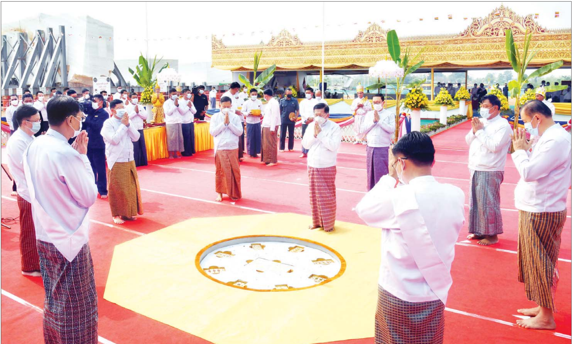
နိုင်ငံတော်စီမံအုပ်ချုပ်ရေးကောင်စီဥက္ကဋ္ဌ တပ်မတော်ကာကွယ်ရေးဦးစီးချုပ် ဗိုလ်ချုပ်မှူးကြီး မင်းအောင်လှိုင်၊ ကောင်စီဒုတိယဥက္ကဋ္ဌ ဒုတိယတပ်မတော်ကာကွယ်ရေးဦးစီးချုပ် ကာကွယ်ရေးဦးစီးချုပ် (ကြည်း) ဒုတိယဗိုလ်ချုပ်မှူးကြီး စိုးဝင်းနှင့်အဖွဲ့ဝင်များ ဗုဒ္ဓဥယျာဉ်တော်တွင် တည်ထားပူဇော်မည့် “မာရဝိဇယ” ဗုဒ္ဓရုပ်ပွားတော်မြတ်ကြီး ရတနာအုတ်မြစ်တော်များအား ပူဇော်စဉ်။ သတင်းစဉ်

နေပြည်တော် ဧပြီ ၂၅ ပြည်ထောင်စုနယ်မြေ၊ နေပြည်တော်၊ ဒက္ခိဏသီရိမြို့နယ်ရှိ ဗုဒ္ဓဥယျာဉ်တော်တွင် တည်ထားပူဇော်မည့် “မာရဝိဇယ” ဗုဒ္ဓရုပ်ပွားတော်မြတ်ကြီး ရတနာအုတ်မြစ်တော်စီအခမ်းအနားကို ယနေ့ နံနက်ပိုင်းတွင် အဆိုပါ ဗုဒ္ဓဥယျာဉ်တော်၊ ဝတ္ထုကံတော်အတွင်း၌ ကျင်းပသည်။