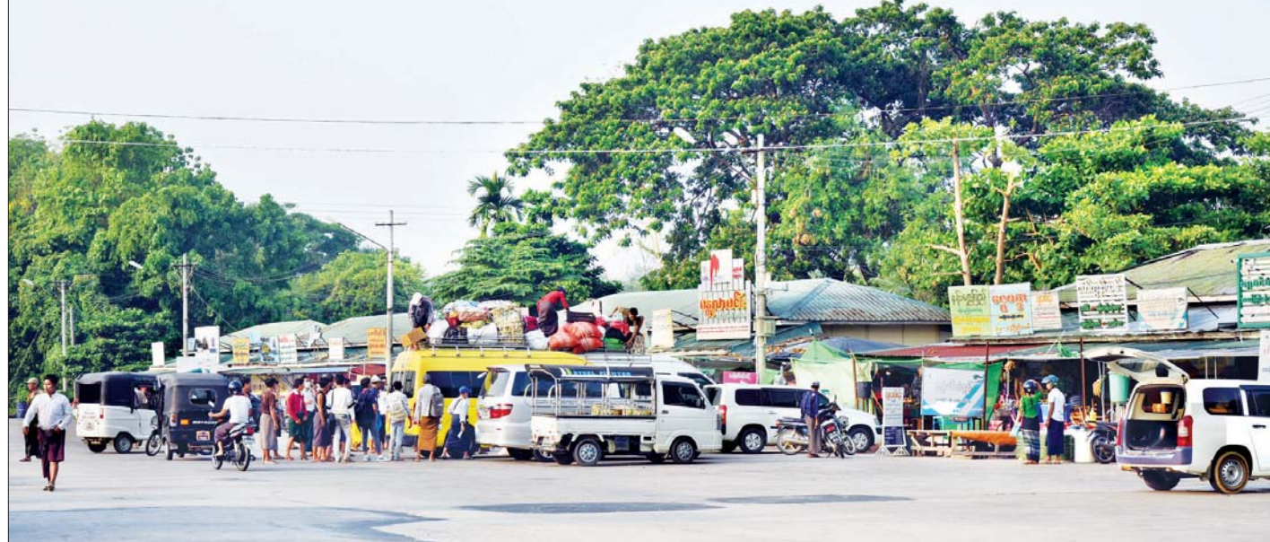
နေပြည်တော်ကောင်စီနယ်မြေရှိ မြို့မဈေးကားဂိတ်၌ ယာဉ်လိုင်းများ ပုံမှန်ပြန်လည်ပြေးဆွဲနေမှုကို တွေ့ရစဉ်။