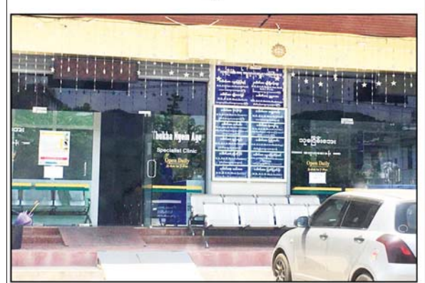
ဒေါက်တာ ကိုကိုနိုင်(လက်ထောက်ဆရာဝန်)အားအပြည်သူ့ဆေးရုံ အား ဆေးကုသခွင့်ပေးထားသည့် "သုခငြိမ်းအေး" မှတ်တမ်းဓာတ်ပုံ