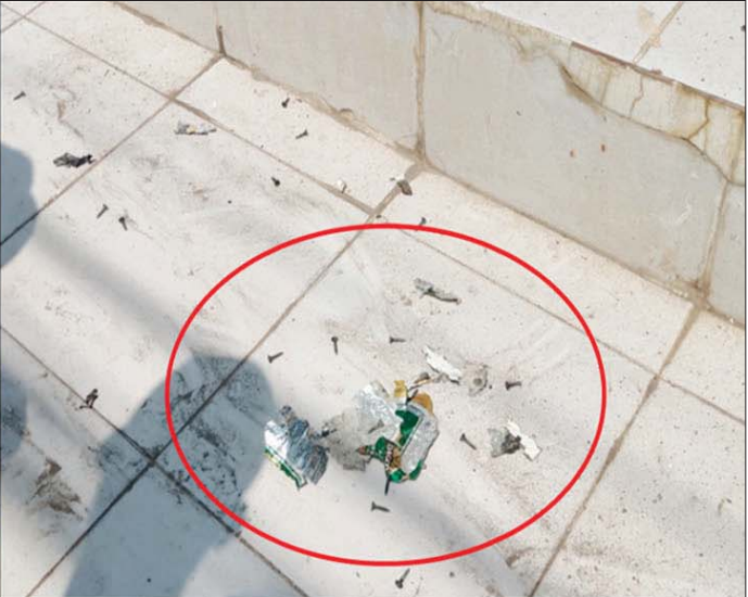
ပြည်မြို့နယ်ရှိ “အင်းဝ”ဘဏ်အား လက်လုပ်ဗုံးဖြင့် ပစ်ခတ်မှုကို တွေ့ရစဉ်။

ကြောင်း သတင်းအရ လုံခြုံရေးတပ်ဖွဲ့ဝင်များက သွားရောက်စစ်ဆေးခဲ့ရာ အဆိုပါရုံးဘေးရှိ လမ်းမပေါ်၌ ပေါက်ကွဲထားသည့် လက်လုပ်ဗုံး အပိုင်းအစများ တွေ့ရှိခဲ့ရပြီး ပေါက်ကွဲမှုကြောင့် လူနှင့် အဆောက်အအုံ ထိခိုက်ဒဏ်ရာရရှိမှုနှင့် ပျက်စီးမှုမရှိကြောင်း သိရသည်။