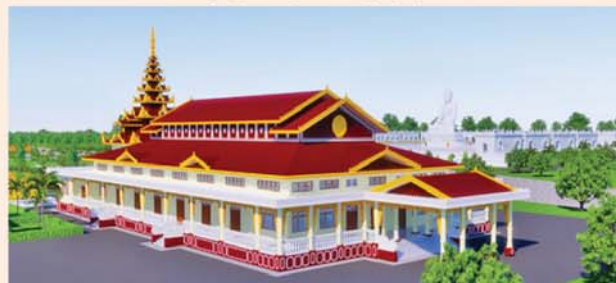
ဓမ္မာရုံ(၂၀၃x၉၀)ပေ ၁ လုံး-၈၇၃၀ သိန်း