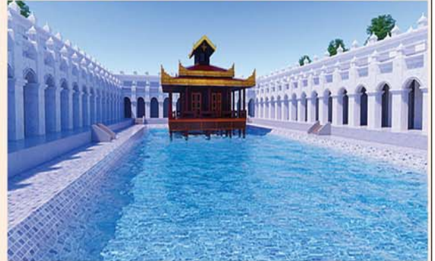
ပုတ်တလုတ်ကန်(၁၉၆x၁၁၆)ပေ ၁ ကန်-၈၂၄၀ သိန်း