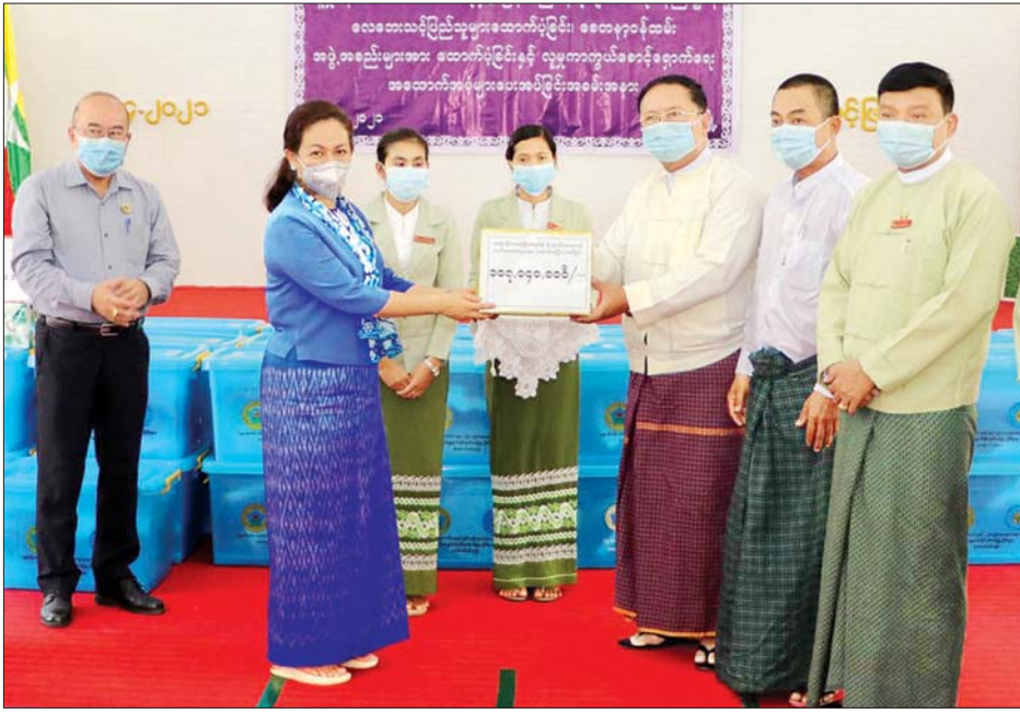
ပြည်ထောင်စုဝန်ကြီး ဒေါက်တာ သက်သက်ခိုင် မကွေးတိုင်းဒေသကြီးအတွင်းရှိ ဂေဟာ/ရိပ်သာ ၁၉ ခု အတွက် ထောက်ပံ့ကြေး ငွေကျပ် ၁၀၇၀၄၀၀၀၀ ထောက်ပံ့ပေးအပ်စဉ်။