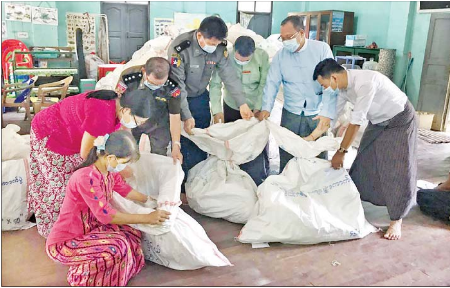
ပဲခူးတိုင်းဒေသကြီး သနပ်ပင်မြို့နယ် ဆန္ဒမဲလက်မှတ်မြေပြင်စစ်ဆေးမှုမှတ်တမ်းဓာတ်ပုံ။