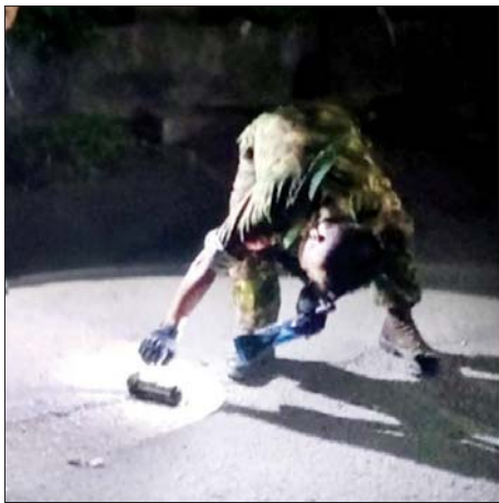
မရမ်းကုန်းမြို့နယ်၌ လက်လုပ်ဗုံး တစ်လုံးပေါက်ကွဲမှု။

အလားတူ မွန်းလွဲ ၁ နာရီ ၅ မိနစ်တွင် မန္တလေးတိုင်းဒေသကြီး မဟာအောင်မြေမြို့နယ် ၇၈ လမ်းနှင့် ၃၈ လမ်းဆုံ မီးပွိုင့်၌ လမ်းရှင်းတာဝန် ဆောင်ရွက်နေသော ယာဉ်ထိန်းတပ်ဖွဲ့ဝင် သုံးဦးအား အကြမ်းဖက်သူ အမျိုးသားနှစ်ဦး မောင်းနှင်လာ