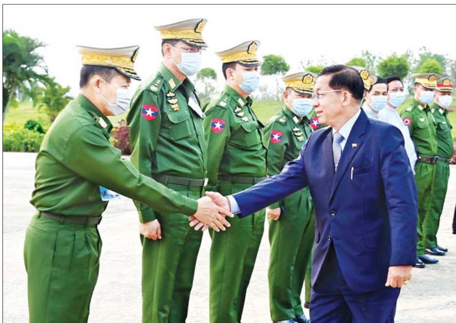
နိုင်ငံတော်စီမံအုပ်ချုပ်ရေးကောင်စီဥက္ကဋ္ဌ၊ တပ်မတော်ကာကွယ်ရေးဦးစီးချုပ် ဗိုလ်ချုပ်မှူးကြီး မင်းအောင်လှိုင်အား နိုင်ငံတော်စီမံအုပ်ချုပ်ရေးကောင်စီ ဒုတိယဥက္ကဋ္ဌ၊ ဒုတိယတပ်မတော်ကာကွယ်ရေးဦးစီးချုပ် ကာကွယ်ရေးဦးစီးချုပ် (ကြည်း) ဒုတိယဗိုလ်ချုပ်မှူးကြီး စိုးဝင်း၊ ကောင်စီဝင်များ၊ ပြည်ထောင်စုဝန်ကြီးများ၊ နေပြည်တော်တိုင်းစစ်ဌာနချုပ် တိုင်းမှူး၊ ဒုတိယဝန်ကြီးများနှင့် တာဝန်ရှိသူများက လေဆိပ်၌ ပို့ဆောင်နှုတ်ဆက်ကြစဉ်။ သတင်းစဉ်

“မြန်မာနိုင်ငံ အနေဖြင့် အာဆီယံ၏ဦးတည်ချက်များ အောင်မြင်စေရန် အာဆီယံပဋိညာဉ်စာတမ်းနှင့် အရှေ့တောင်အာရှ ချစ်ကြည်ရေးနှင့် ပူးပေါင်းဆောင်ရွက်ရေး စာချုပ် (TAC)ပါ အခြေခံမူများနှင့်အညီ အာဆီယံ အဖွဲ့ဝင်နိုင်ငံများနှင့်အတူ နီးကပ်စွာ ပူးပေါင်းဆောင်ရွက်သွားမည့် ကိစ္စရပ်များ ဆွေးနွေးပြောကြား”