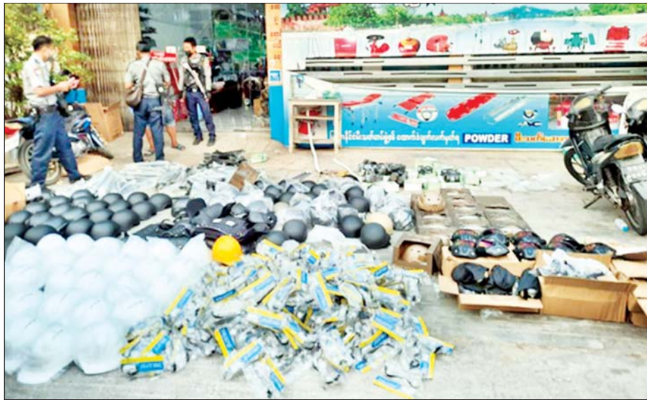
ချမ်းအေးသာစံမြို့နယ်၌ ဆူပူအကြမ်းဖက်ရာတွင် အသုံးပြုသည့် ဆက်စပ်ပစ္စည်းများ သိမ်းဆည်းရမိစဉ်။

အလားတူ ညနေ ၅ နာရီတွင် မန္တလေးတိုင်းဒေသ ကြီး ချမ်းအေးသာစံမြို့နယ် ပြည်ကြီးမျက်ရှင် ရပ်ကွက် ၆၃လမ်း၊ ၂၈လမ်းနှင့် ၂၉လမ်းကြားရှိ "မအိ" စတိုးဆိုင်အား သတင်းအရ ဝင်ရောက်ရှာဖွေခဲ့ရာ ဆိုင်ရှင်အား မတွေ့ရှိရဘဲ အဆိုပါစတိုးဆိုင်အတွင်းမှ ဆူပူအကြမ်းဖက်ရာတွင် အသုံးပြုသည့် ဦးထုပ်မျိုးစုံ ၁၃၃ လုံး၊ လက်ထိပ်မျိုးစုံ ၂၆၂ ခု၊ ရော်ဘာတုတ်မျိုးစုံ ၂၀၁ ချောင်း၊ နှာခေါင်းအုပ်မျက်နှာဖုံး ၉၂ ခု၊ နှာခေါင်း စွပ်မျက်မှန် ၁၆ ခု၊ မျက်မှန်အကြည် ၂၁၁ ခု၊ PPE ဝတ်စုံ တစ်စုံ၊ BAT တံဆိပ်ပါ တုတ်နှစ်ချောင်း၊ Police စာတန်းပါ ငရုတ်သီးအရည်ဖြင့် ပြုလုပ်ထားသော ဖျန်းဆေးဘူး တစ်ဘူးနှင့် အခြားဆက်စပ်ပစ္စည်း