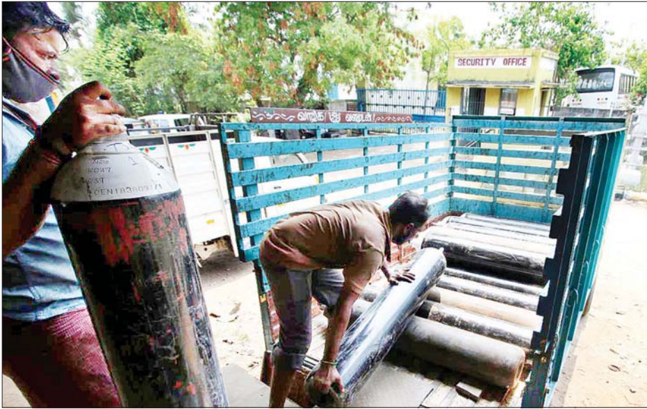
ဧပြီ ၂၄ ရက်က အိန္ဒိယနိုင်ငံ ချန်နိုင်းတွင် ကုန်တင်ယာဉ်ပေါ်သို့ အောက်ဆီဂျင်ဘူးများ တင်ဆောင်နေသည်ကို တွေ့ရစဉ်။

နယူးဒေလီ ဧပြီ ၂၄ အိန္ဒိယနိုင်ငံ မြို့တော် နယူးဒေလီရှိ ဆေးရုံတစ်ရုံသို့ အရေးပေါ်တင်လိုက်ရသော ကိုဗစ်-၁၉ လူနာ ၂၀ သည် အောက်ဆီဂျင်ပြတ်လပ်မှုကြောင့် သေဆုံးခဲ့ကြောင်း သက်ဆိုင်ရာ အရာရှိများက ဧပြီ ၂၄ ရက်က ပြောကြားလိုက်သည်။