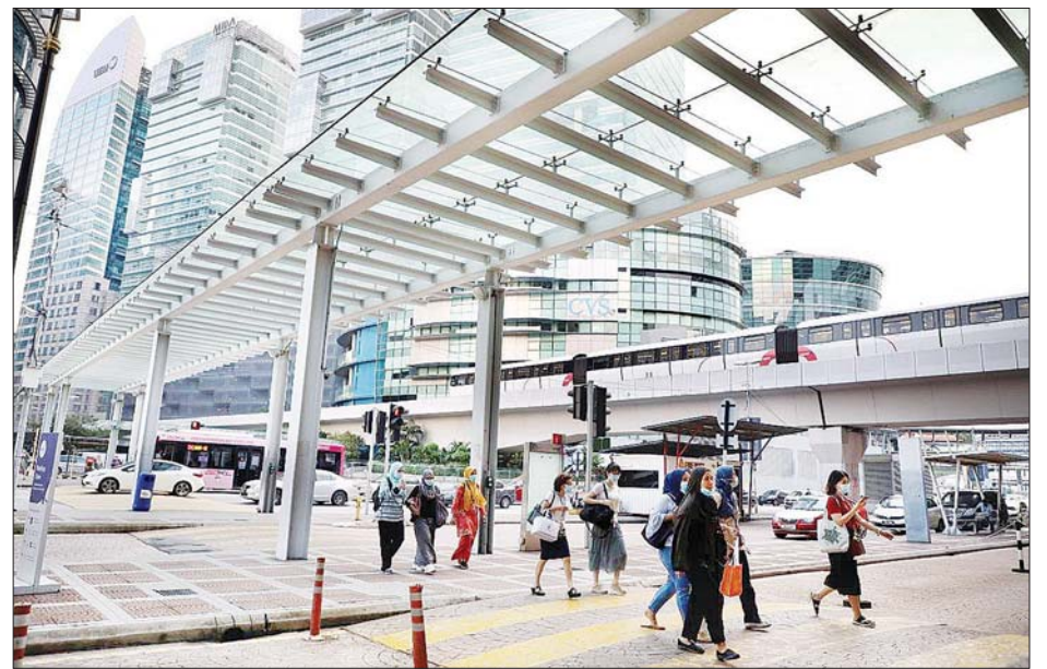
မလေးရှားနိုင်ငံ ကာလာလမ်ပူမြို့ တစ်နေရာတွင် ကိုဗစ်-၁၉ ကူးစက်မှုကို ကာကွယ်ရန် ပြည်သူများ ပါးစပ်၊ နှာခေါင်းစည်း တပ်ဆင်သွားလာနေသည်ကို တွေ့ရစဉ်။

ကိုဗစ်-၁၉ ကြောင့်နောက်ထပ် သေဆုံးသူ ၁၁ ဦး ရှိလာကြောင်း ဖော်ပြမှုနှင့်အတူ စုစုပေါင်း သေဆုံးသူ ၁၄၂၆ ဦး ရှိလာပြီ ဖြစ်ကြောင်း သိရသည်။