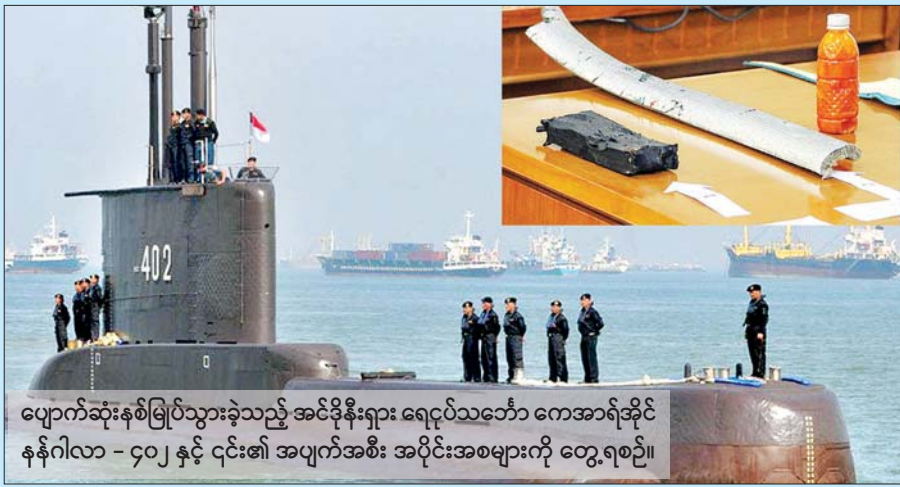
ပျောက်ဆုံးနှစ်မြှုပ်သွားခဲ့သည့် အင်ဒိုနီးရှား ရေငုပ်သင်္ဘော ကေအာရ်အိုင်နန်ဂါလာ - ၄၀၂ နှင့် ၎င်း၏ အပျက်အစီး အပိုင်းအစများကို တွေ့ရစဉ်။

သင်္ဘောရှာဖွေမှုများပြုလုပ်ရာတွင် ဩစတြေးလျ၊ အိန္ဒိယ၊ မလေးရှားနှင့် စင်ကာပူနိုင်ငံတို့မှ အကူအညီများပေးပို့ထားကြောင်း သိရသည်။ ထို့အပြင် ဧပြီ ၂၄ ရက်အစောပိုင်းက အမေရိကန်ရေတပ် ပီ-အိတ်ချ်ပိုဆိုက်ဒွန် လေယာဉ်တင်သင်္ဘောလည်း ဘာလီသို့ ရောက်ရှိလာခဲ့သည်။ အင်ဒိုနီးရှားနိုင်ငံသည် မိတ်ဆွေကောင်းနိုင်ငံဖြစ်ပြီး မဟာဗျူဟာမြောက်မိတ်ဖက်ဖြစ်ကြောင်းနှင့် ရေငုပ်သင်္ဘောအစီရင်ခံစာ ဖော်ပြမှုနှင့်ပတ်သက်ပြီး အလွန်စိတ်မကောင်းဖြစ်ကြောင်း ပင်တဂွန်ပြောရေးဆိုခွင့်ရှိသူ ဂျွန်ကာဘီက