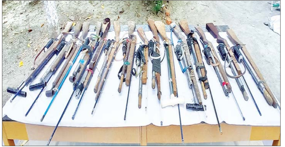
ပဲခူးတိုင်းဒေသကြီး ပန်းတောင်းမြို့နယ်အတွင်း လာရောက်အပ်နှံသည့် လက်လုပ်သေနတ်များကို တွေ့ရစဉ်။

အတူ သွားရောက်၍ ဒေသခံပြည်သူများကို တရားမဝင် လက်နက်ကိုင်ဆောင်ခြင်းသည် တရားဥပဒေဖြင့် ထိရောက်စွာ အရေးယူခံရနိုင်ကြောင်း နားလည်သဘောပေါက်အောင် ရှင်းလင်းပြောကြားသည်။ ယင်းသို့ ရှင်းလင်းပြောကြားမှုကြောင့် ကျေးရွာနေ ပြည်သူများက နားလည်သဘောပေါက်ကာ ဒူးလေး လေးလက်၊ တူမီးသေနတ် ၄၃ လက်၊ လေသေနတ် ၁၃ လက်၊ လက်လုပ်သေနတ် ၃၃ လက်နှင့် ဆက်စပ်ပစ္စည်းများကို ၎င်းတို့ သဘောဆန္ဒအလျောက် လုံခြုံရေးတပ်ဖွဲ့ဝင်များထံသို့ လာရောက်အပ်နှံခဲ့ကြကြောင်း သတင်းရရှိသည်။