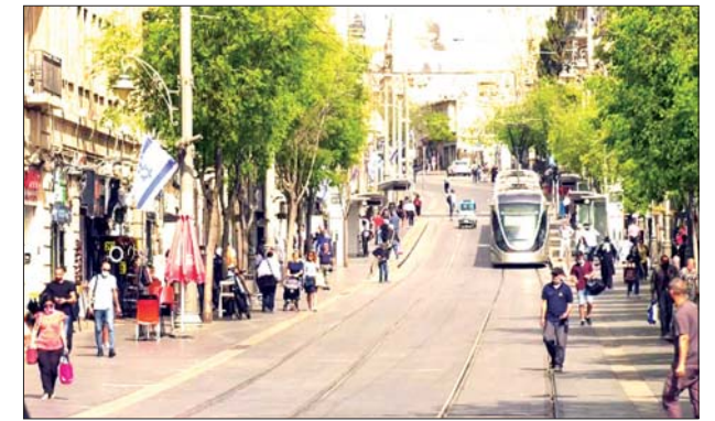
အစ္စရေးနိုင်ငံတွင် ပါးစပ်၊ နှာခေါင်းစည်း မတပ်ဆင်ဘဲ သွားလာလှုပ်ရှားနေကြသူများကို တွေ့ရစဉ်။