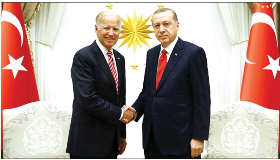
အမေရိကန် သမ္မတ ဂျိုးဘိုင်ဒင်နှင့် တူရကီသမ္မတ အာဒိုဂန်တို့ ၂၀၁၆ ခုနှစ် ဩဂုတ်လအတွင်းက အန်ကာရာမြို့တွင် တွေ့ဆုံကြစဉ်။

တူရကီသမ္မတ အာဒိုဂန်က အမေရိကန်တွင် ရောက်ရှိနေသည့် တူရကီဘုန်းကြီး