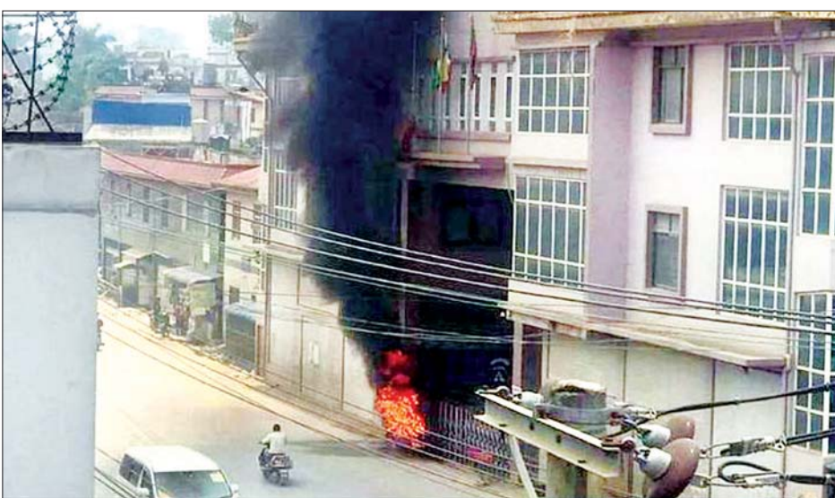
မူဆယ်မြို့ ကောင်းမှုတုံ့ရပ်ကွက်ရှိ တရုတ်-မြန်မာ ဝင်/ထွက်ပေါက် နန်းတော်ရှေ့ ဂိတ်ပေါက်တံခါး အနီး လမ်းမပေါ်၌ တာယာကွင်းများ မီးရှို့ထားသည်ကို တွေ့ရစဉ်။