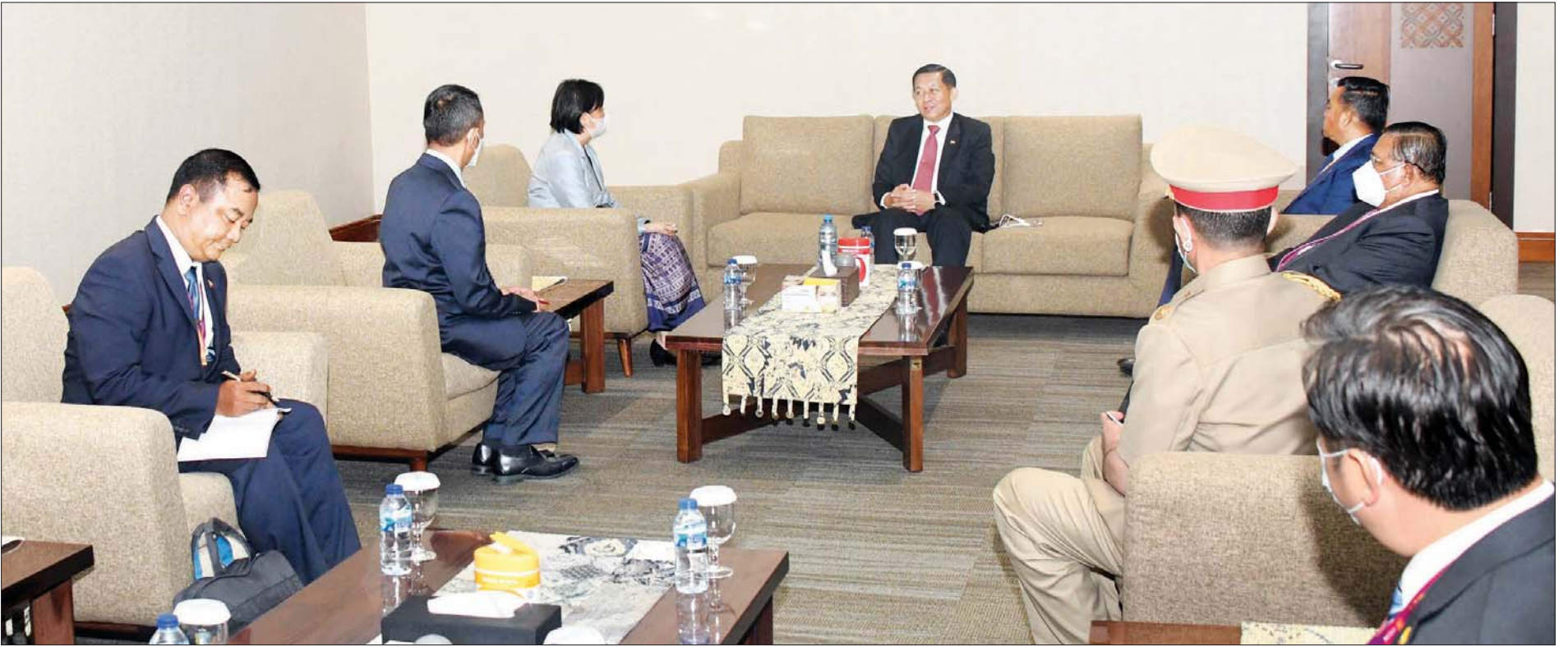
နိုင်ငံတော်စီမံအုပ်ချုပ်ရေးကောင်စီဥက္ကဋ္ဌ၊ တပ်မတော်ကာကွယ်ရေးဦးစီးချုပ် ဗိုလ်ချုပ်မှူးကြီး မင်းအောင်လှိုင် မြန်မာသံရုံး၊ စစ်သံရုံးတို့မှ မိသားစုများနှင့် တွေ့ဆုံစဉ်။ သတင်းစဉ်