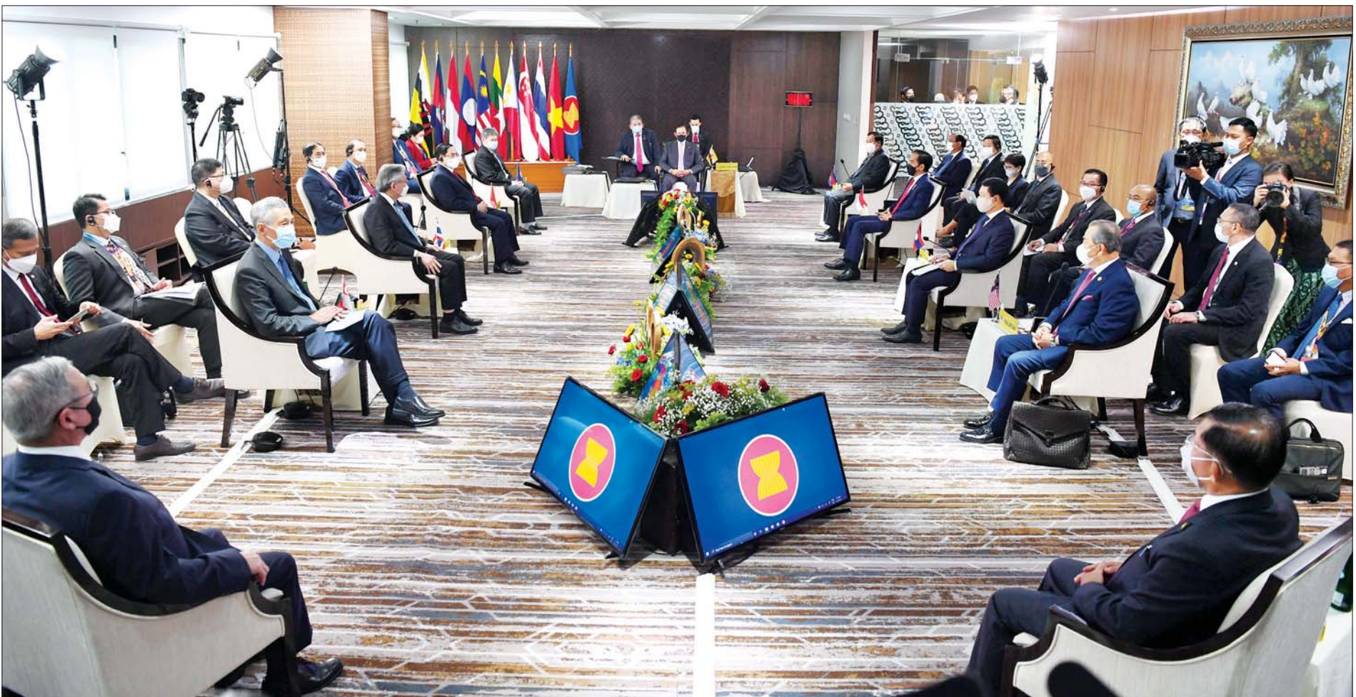
အာဆီယံနိုင်ငံ့ခေါင်းဆောင်များအစည်းအဝေး ကျင်းပစဉ်။ သတင်းစဉ်

မြန်မာ့နိုင်ငံရေးဖြစ်ပေါ်ပြောင်းလဲမှုများ၊ ရှေ့ဆက်ဆောင်ရွက်မည့်လုပ်ငန်းစဉ်များနှင့်ပတ်သက်၍ ဆွေးနွေးပြောကြား