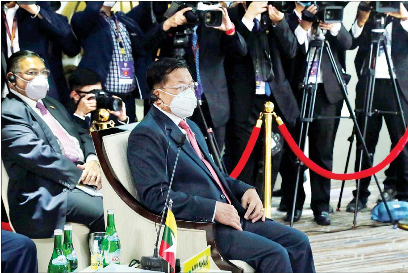
နိုင်ငံတော်စီမံအုပ်ချုပ်ရေးကောင်စီဥက္ကဋ္ဌ၊ တပ်မတော်ကာကွယ်ရေးဦးစီးချုပ် ဗိုလ်ချုပ်မှူးကြီး မင်းအောင်လှိုင် အာဆီယံနိုင်ငံခေါင်းဆောင်များအစည်းအဝေးသို့ တက်ရောက်စဉ်။ သတင်းစဉ်

“မြန်မာနိုင်ငံ အနေဖြင့် အာဆီယံ၏ဦးတည်ချက်များ အောင်မြင်စေရန် အာဆီယံပဋိညာဉ်စာတမ်းနှင့် အရှေ့တောင်အာရှ ချစ်ကြည်ရေးနှင့် ပူးပေါင်းဆောင်ရွက်ရေး စာချုပ် (TAC)ပါ အခြေခံမူများနှင့်အညီ အာဆီယံ အဖွဲ့ဝင်နိုင်ငံများနှင့်အတူ နီးကပ်စွာ ပူးပေါင်းဆောင်ရွက်သွားမည့် ကိစ္စရပ်များ ဆွေးနွေးပြောကြား”