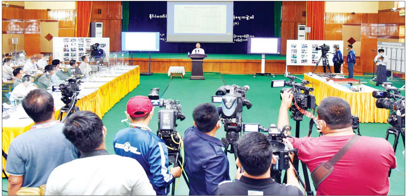
နိုင်ငံတော်စီမံအုပ်ချုပ်ရေးကောင်စီ၊ သတင်းထုတ်ပြန်ရေးအဖွဲ့၏ ၄/၂၀၂၁ ကြိမ်မြောက် သတင်းစာရှင်းလင်းပွဲကျင်းပစဉ်။

မှလည်း တစ်ခုံနှစ်ယောက်စာ ပေးစီးရသည့်အတွက် နစ်နာမှုရှိကြောင်း၊ ပြည်သူလူထုသည် အရေးပေါ်အခြေအနေတစ်ရပ်ကြောင့် ခါးစည်းခံရသည့် သဘောဖြစ်ကြောင်း၊ ယင်းကိစ္စအတွက် နိုင်ငံတော်မှ စီစဉ်ပေးရန် ရှိ/မရှိ သိလိုကြောင်း၊ လက်လုပ်လက်စားများ အရေးပေါ်အခြေအနေကြောင့် အပြင်မထွက်ရသည်များရှိကြောင်း၊ Covid-19 ကြောင့် အပြင်မထွက်ရသည်များလည်း ရှိပါကြောင်း၊ လက်လုပ်လက်စား၊ တစ်နေ့လုပ်တစ်နေ့စား ပြည်သူများ အလုပ်အကိုင်အခက်အခဲများ ဖြစ်ပေါ်ခဲ့ပါကြောင်း၊ နိုင်ငံတော်စီမံအုပ်ချုပ်ရေးကောင်စီအနေဖြင့် ပြည်သူလူထု လုပ်ကိုင်မည့် အခွင့်အလမ်းများ ဖွင့်ပေးစေလိုကြောင်း၊ အခွင့်အလမ်းများဖွင့်ပေးရန် မည်သို့စီစဉ်ထားသည်ကို သိလိုကြောင်း၊ အုပ်ချုပ်ရေးပိုင်းအနေဖြင့် ရပ်ကွက်၊ ကျေးရွာအုပ်ချုပ်ရေးကို တည်ငြိမ်အောင်၊ ပီပြင်အောင် မည်သို့ဆောင်ရွက်ပေးမည်ကို သိလိုကြောင်း