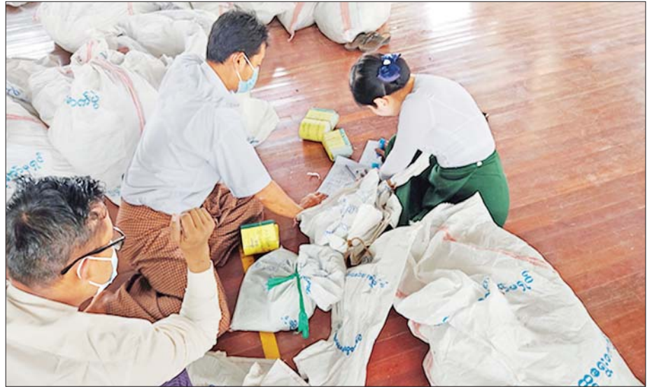
စဉ့်ကူးမြို့၌ မဲစာရင်းများအား စစ်ဆေးခြင်း မှတ်တမ်းဓာတ်ပုံ။