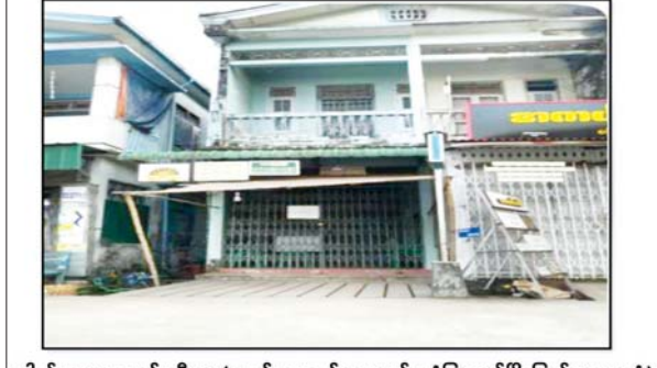
ဒေါက်တာ အေးနန်းသီတာ(လက်ထောက်ဆရာဝန်၊ သံဖြူဇရပ်မြို့ပြည်သူ့ဆေးရုံ) ဖွင့်လှစ်ထားသည့်ဆေးခန်း မှတ်တမ်းဓာတ်ပုံ