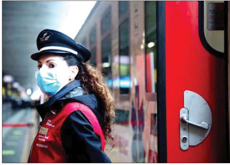
ရထားဝန်ထမ်းတစ်ဦးကို တွေ့ရစဉ်။