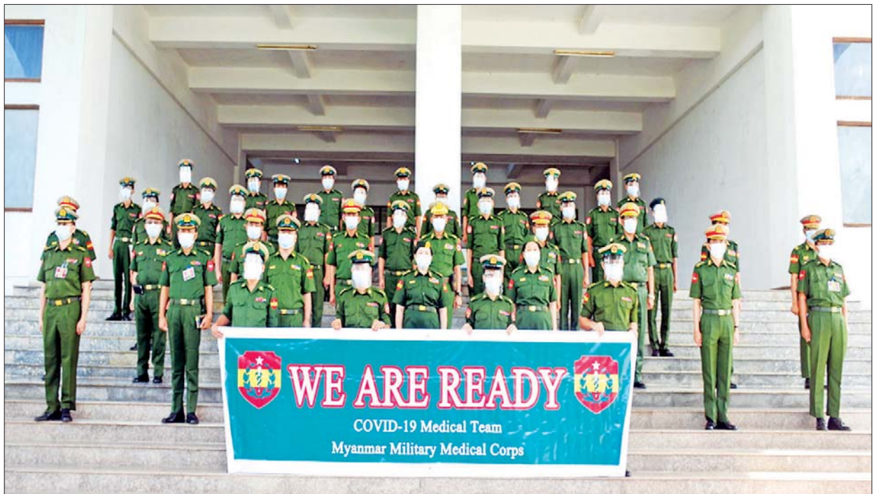
COVID-19 ရောဂါကုသရေးဌာန (ဖောင်ကြီး)တွင် တာဝန်လဲလှယ်ထမ်းဆောင်မည့် ဆေးဝန်ထမ်းတပ်ဖွဲ့ဝင်များကို တွေ့ရစဉ်။