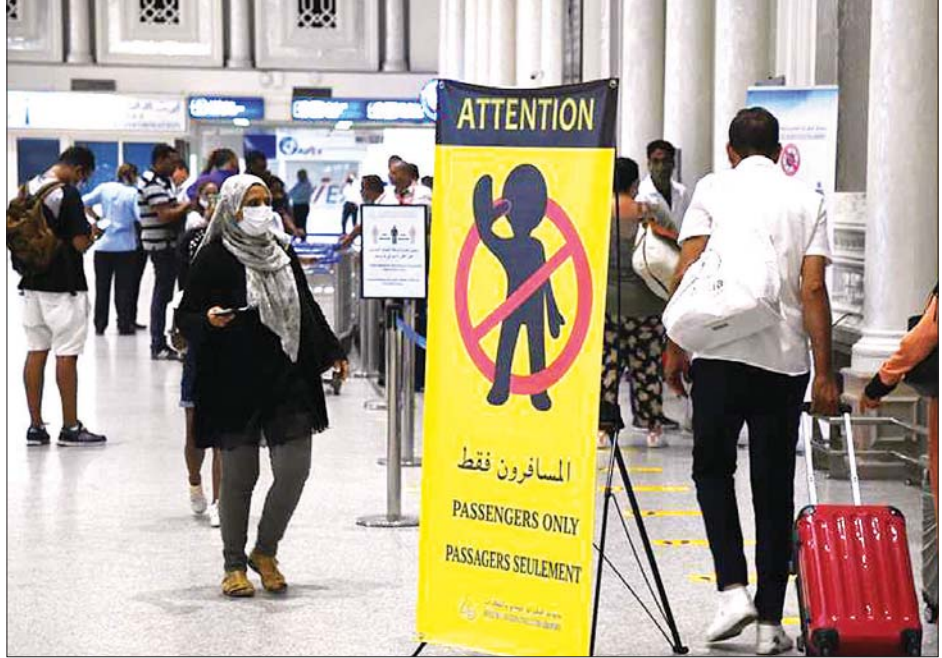
တူးနစ်မြို့၊ အပြည်ပြည်ဆိုင်ရာလေဆိပ်တွင် ခရီးသွားများကို တွေ့ရစဉ်။