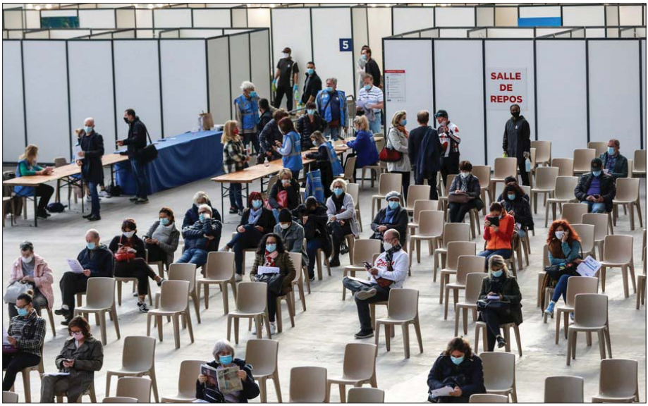
ပြင်သစ်နိုင်ငံတောင်ပိုင်းတွင် ကိုဗစ် - ၁၉ ကာကွယ်ဆေးထိုးနှံမှုခံယူရန် စောင့်ဆိုင်းနေကြသူများကို တွေ့ရစဉ်။

ယင်းအခြေအနေကို ကျော်လွှားနိုင်ရန်အတွက် နိုင်ငံအများအပြားအနေဖြင့် ကိုဗစ် - ၁၉ ကာကွယ်ဆေးများကို လျှင်မြန်စွာ ပြုလုပ်ကြရန်