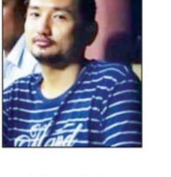
ဒေါက်တာ ဖုန်းမင်းစော