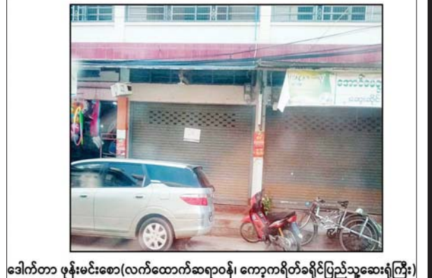
ဒေါက်တာ ဖုန်းမင်းစော(လက်ထောက်ဆရာဝန်၊ ကော့ကရိတ်ခရိုင်ပြည်သူ့ဆေးရုံကြီး) ဖွင့်လှစ်ထားသည့် “ဖုန်းမင်းစော” ဆေးခန်း မှတ်တမ်းဓာတ်ပုံ