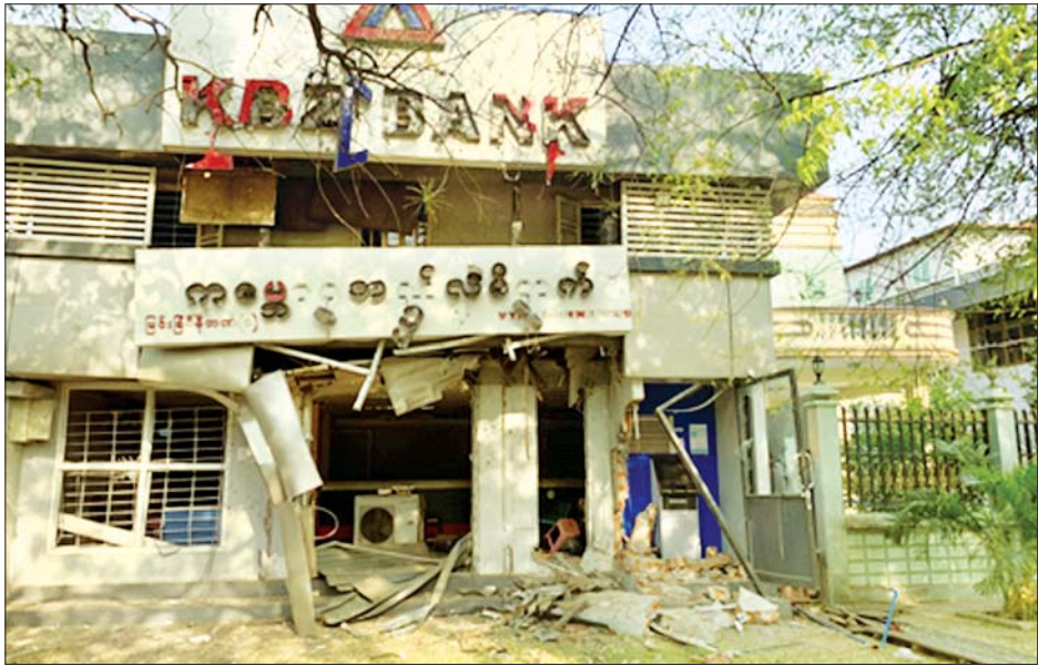
မြင်းခြံ KBZ ဘဏ်အား ဆူပူအကြမ်းဖက်သူများက လက်လုပ်မိုင်းဖြင့် လာရောက်ပစ်ခတ်အပြီး တွေ့ရစဉ်။

အလားတူ ဧပြီ ၁၈ ရက် ၂၀ တွင် ရန်ကုန်တိုင်းဒေသကြီး တောင်ဒဂုံမြို့နယ် အမှတ်(၁၈) ရပ်ကွက် ရပ်ကွက်စီမံအုပ်ချုပ်ရေး အဖွဲ့ရုံးအား ဆူပူအကြမ်းဖက်သူ လူတစ်စုမှ မီးရှို့၍ မီးလောင်နေ ကြောင်း သတင်းအရ လုံခြုံရေး တပ်ဖွဲ့ဝင်များနှင့် မီးသတ်တပ်ဖွဲ့ ဝင်များက သွားရောက်စစ်ဆေး သတ်ခဲ့ရာ နံနက် ၂ နာရီ မိနစ် ၅၀ တွင် မီးငြိမ်းသွားခဲ့ပြီး မီးလောင် မှုကြောင့် သွပ်မိုး၊ အုတ်ကာ၊ အုတ်ခင်းအဆောက်အအုံတစ်လုံး၊ ရုံးတွင်းပရိဘောဂများ မီးလောင် ဆုံးရှုံးခဲ့ပြီး လူထိုခိုက်ဒဏ်ရာရရှိမှု မရှိကြောင်း သိရှိရသည်။