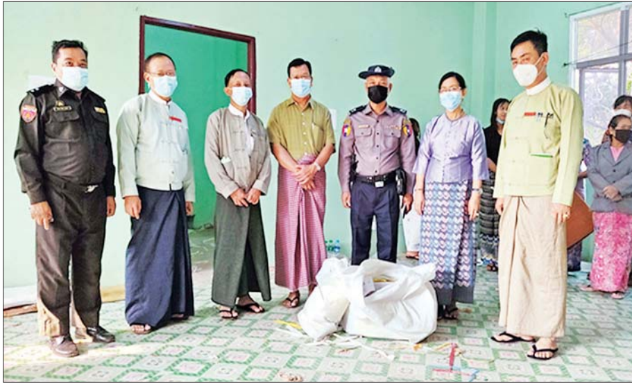
ပြင်ဦးလွင်မြို့၌ မဲစာရင်းများအား စစ်ဆေးခြင်း မှတ်တမ်းဓာတ်ပုံ။