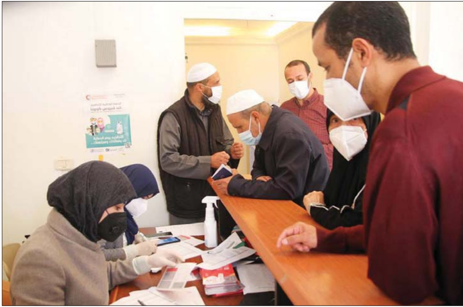
ကာကွယ်ဆေးထိုးရန် စာရင်းပေးသွင်းနေကြသူများကို တွေ့ရစဉ်။