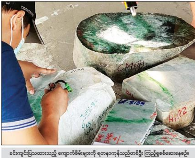
ခင်းကျင်းပြသထားသည့် ကျောက်စိမ်းများကို ရတနာကုန်သည်တစ်ဦး ကြည့်ရှုစစ်ဆေးနေစဉ်။

နေပြည်တော် ဧပြီ ၆ ပုလဲအတွဲများနှင့် ကျောက်မျက်ရတနာများ မြန်မာ ကျပ်ငွေဖြင့်ရောင်းချပွဲ ဆဋ္ဌမနေ့ကို ယနေ့ နံနက် ပိုင်းတွင် နေပြည်တော်ရှိ မတီရတနာ ကျောက်စိမ်း ခန်းမ၌ ကိုဗစ် - ၁၉ ကာကွယ်ရေးလမ်းညွှန်ချက်များ နှင့်အညီ ဆက်လက်ကျင်းပသည်။ ယနေ့နံနက် ၈ နာရီတွင် ရောင်းချပွဲ ပဉ္စမနေ့ က အိတ်ဖွင့်တင်ဒါစနစ်ဖြင့် ရောင်းချပေးခဲ့သည့် ကျောက်စိမ်းအတွဲအမှတ်(၁) မှ အတွဲအမှတ် (၄၅၀) အထိ အတွဲပေါင်း (၄၅၀) တွင် ကျောက်စိမ်းအတွဲ ၃၂၆ တွဲ ကို မြန်မာငွေကျပ် ၃၉၂၂၉၇၃၁၁ ဖြင့် ရောင်းချနိုင်ခဲ့ကြောင်း ကြေညာခဲ့သည်။ ယခုရောင်းချပွဲ ဆဋ္ဌမနေ့တွင် ကျောက်စိမ်း အတွဲအမှတ်(၄၅၁) မှ အတွဲအမှတ် (၉၀၀) အထိ ကို အိတ်ဖွင့်တင်ဒါစနစ်ဖြင့် ရောင်းချပေးခဲ့ရာ ရတနာကုန်သည်များက မတီရတနာကျောက်စိမ်း ခန်းမအတွင်း သတ်မှတ်နယ်မြေအလိုက် ခင်းကျင်း ပြသထားသည့် ကျောက်စိမ်း အတွဲများကို စာမျက်နှာ ၉ ကော်လံ ၅ ။