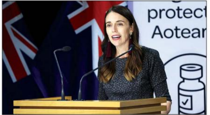
နယူးဇီလန်ဝန်ကြီးချုပ် ဂျက်စင်ဒါအာဒန်။

သို့သော်လည်း ကူးစက်မှုပေါ်ပေါက်လာပါက ခရီးသွားလာမှုတွင် အငြင်းပွားမှုများ ဖြစ်ပေါ်လာနိုင်သည်ကိုမူ ပြည်သူများ စိစစ်ထားသင့်သည်ဟု ၎င်းက သတိပေးပြောကြားခဲ့သည်။ အသွားအလာကန့်သတ်မှု ကင်းလွတ်ခွင့်ဖြင့် ခရီးသွားရာတွင် ပြည်သူများအနေဖြင့် ကိုဗစ်-၁၉ ဆေးစစ်ချက်ပြုသရန် မလိုသလို ၁၄ ရက်တာကာလအတွင်း ကိုဗစ်-၁၉ ဆေးစစ်ချက်ကို စောင့်ဆိုင်းစရာမလိုဟု သိရသည်။ ဆင်ဟွာ