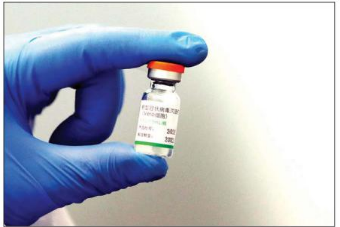
ဆီနီမင်းကိုဗစ်-၁၉ ကာကွယ်ဆေးကို တွေ့ရစဉ်။

နိုပေါနိုင်ငံတွင် ကိုဗစ်-၁၉ ကာကွယ်ဆေးများကို လုံလုံလောက်လောက် ဆက်လက်ထိုးနှံပေးနိုင်ရန်