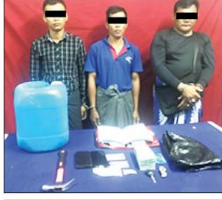
သယ်နှံကျွန်းမြို့နယ် ဆူပူအကြမ်းဖက်မှုတွင် ဖမ်းဆီးရမိသူများအား အသုံးပြုသည့်ပစ္စည်းများနှင့်အတူ တွေ့ရစဉ်။