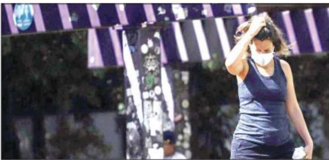
ဘရာဇီးနိုင်ငံ ဆော်ပေါလိုတွင် အမျိုးသမီးတစ်ဦး ပါးစပ်၊ နှာခေါင်းစည်းတပ်ဆင်ပြီး သွားလာနေသည်ကို တွေ့ရစဉ်။

ဆော်ပေါလို ဧပြီ ၆ ဘရာဇီးနိုင်ငံတွင် ဧပြီ ၅ ရက်က ကိုဗစ်-၁၉ ထပ်မံကူးစက်ဖြစ်ပွားမှု သူ ၂၈၆၄၅ ဦးရှိကြောင်း ဖော်ပြမှုနှင့်အတူ စုစုပေါင်းနိုင်ငံအတွင်း ကိုဗစ်-၁၉ ကူးစက်ဖြစ်ပွားသူ ၁၃၀၃၆၀၀ ဦး ရှိလာပြီဖြစ်သည်။ ထို့အပြင် ထပ်မံသေဆုံးသူ ၁၃၀၉၂ ဦး ရှိကြောင်း ဖော်ပြမှုနှင့်အတူ စုစုပေါင်း သေဆုံးသူ ၃၂၇၅၂ ဦး ရှိလာကြောင်း ကျန်းမာရေးဝန်ကြီးဌာနက ဧပြီ ၅ ရက်တွင် ပြောကြားလိုက်သည်။