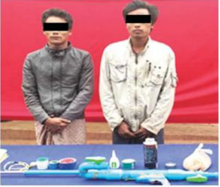
လားရှိုးဆူပူအကြမ်းဖက်မှုတွင် ဖမ်းဆီးရမိသူများအား အသုံးပြုသည့် ပစ္စည်းများနှင့်အတူ တွေ့ရစဉ်။