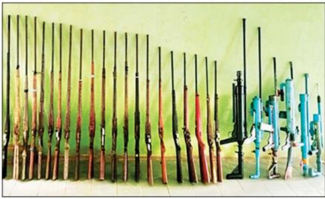
တနင်္သာရီမြို့နယ်၊ မောတောင်မြို့ ဆူပူအကြမ်းဖက်မှုတွင် အသုံးပြုသည့် လက်လုပ်သေနတ်များ။ သတင်းစဉ်

စစ်ကိုင်းတိုင်းဒေသကြီး မင်းကင်းမြို့နယ်အတွင်းရှိ မုတ္တမကျေးရွာ၊ သံပေါက်ကျေးရွာ၊ လောင်းပြည်ကျေးရွာ၊ အိုးဘိုကျေးရွာ၊ တိုင်းကျေးရွာ၊ ရွာသစ်ကုန်းကျေးရွာ၊ ကျောက်ခဲတက်ကျေးရွာ၊ တုံကျေးရွာ၊ ပိတ်ချင်းတောကျေးရွာနှင့် ကုန်းရင်ကျေးရွာများမှ NLD ပါတီဝင် ဆူပူအကြမ်းဖက်သူ ၇၀၀ ခန့်သည် ဧပြီ ၅ ရက် နံနက် ၁၀ နာရီခန့်တွင် ပန်းဆက်ကျေးရွာရှိ ရွာသူ၊ ရွာသားများကို ဓာတ်ဆီပုလင်းများဖြင့် ပစ်ခတ်ခြင်း၊ တူးဖော်သေနတ်၊ တုတ်၊ ဓား၊ လေးခွများဖြင့် ပစ်ခတ် တိုက်ခိုက်ခြင်းများ လာရောက်ဆောင်ရွက်ခဲ့သဖြင့် ကျေးရွာရှိနေအိမ် နှစ်လုံး မီးလောင်ပျက်စီးခဲ့ပြီး ရွာသားတစ်ဦး တူးဖော်သေနတ်ထိမှန် သေဆုံးခဲ့ကာ လေးဦးတို့တွင် တူးဖော်သေနတ် ထိမှန်ဒဏ်ရာများ ရရှိခဲ့ကြောင်း သိရသည်။ အဆိုပါ ဖြစ်စဉ်ဖြစ်ပွားရာနေရာသို့ လုံခြုံရေးတပ်ဖွဲ့ဝင်များက သွားရောက်၍ လိုအပ်သည့် လုံခြုံရေးလုပ်ငန်းများ ဆောင်ရွက်ပေးပြီး စိုးရိမ်ရဒဏ်ရာရှိသူတစ်ဦးအား ကနိမြို့ ပြည်သူ့ဆေးရုံသို့ ပို့ဆောင် ဆေးကုသမှုခံယူစေလျက်ရှိကြောင်း သတင်းရရှိသည်။ သတင်းစဉ်