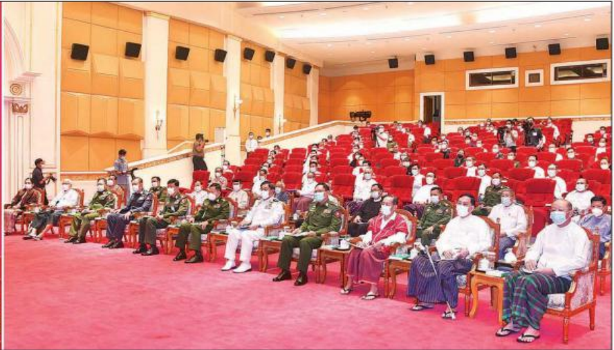
နိုင်ငံတော်စီမံအုပ်ချုပ်ရေးကောင်စီဥက္ကဋ္ဌ တပ်မတော်ကာကွယ်ရေးဦးစီးချုပ် ဗိုလ်ချုပ်မှူးကြီး မင်းအောင်လှိုင် ပြည်ထောင်စုအဆင့်ပုဂ္ဂိုလ်များ၊ ပြည်ထောင်စုဝန်ကြီးများ၊ နေပြည်တော်ကောင်စီဥက္ကဋ္ဌ၊ တိုင်းဒေသကြီးနှင့် ပြည်နယ်စီမံအုပ်ချုပ်ရေးကောင်စီဥက္ကဋ္ဌများ၊ ကိုယ်ပိုင်အုပ်ချုပ်ခွင့်ရတိုင်းနှင့် ဒေသ စီမံအုပ်ချုပ်ရေးအဖွဲ့ဥက္ကဋ္ဌများအား တွေ့ဆုံအမှာစကား ပြောကြားစဉ်။