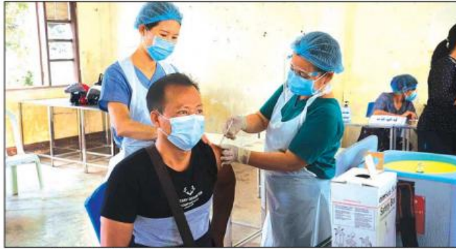
ဘားအံမြို့နယ်တွင် ကိုဗစ်-၁၉ ရောဂါကာကွယ်ဆေးကို မတ် ၆ ရက်မှစတင်၍ ဆရာတော်၊ သံဃာတော်၊ ရဟန်း၊ သာမဏေ၊ သီလရှင်များ၊ ဌာနဆိုင်ရာဝန်ထမ်းများ၊ ဒေသပြည်သူများအား ထိုးနှံပေးခဲ့ရာ ပထမအကြိမ်အနေဖြင့် စုစုပေါင်း လူဦးရေ ၈၁၀၉ ဦးကို ထိုးနှံပေးခဲ့ပြီးဖြစ်ကြောင်း သိရှိရသည်။

ဘားအံမြို့နယ်တွင် ဒုတိယအကြိမ် ကိုဗစ် - ၁၉ ကာကွယ်ဆေးထိုးနှံရန်အဖြစ် အမှတ်(၂)(၃)(၄)(၅) အခြေခံပညာအထက်တန်းကျောင်းများနှင့် အမှတ်(၂) အခြေခံပညာအထက်တန်းကျောင်း(ခွဲ)တို့တွင် လေးနေရာခွဲ၍ ပြည်သူ့ကျန်းမာရေးဦးစီးဌာနမှ ဝန်ထမ်းများဦးဆောင်ပြီး ပညာရေးဝန်ထမ်းများ၊ စေတနာ့ဝန်ထမ်းများ ပူးပေါင်း၍ နံနက် ၈ နာရီမှ ညနေ ၄ နာရီအထိ ဧပြီ ၅ ရက်မှ ၇ ရက်အထိ ထိုးနှံပေးမည်ဖြစ်ပါသည်။