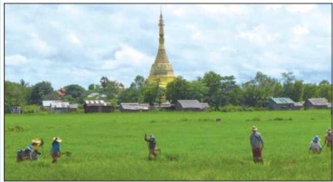
ဆံတော်ရှင် ကျိုက်ဓနုတ်စေတီတော်ကြီးနှင့် ပတ်ဝန်းကျင်ရှုခင်းများ။

ဆုတောင်းပြည့် ကျိုက်ဓနုတ်ဆံတော်ရှင်စေတီ သမိုင်းသစ်၊ သမိုင်းဟောင်း(ရွှေပြည်တီနီ)