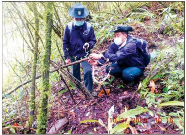
အာဆီယံအမွေအနှစ် ခေါ်နူးဆုမ်းအမျိုးသားဥယျာဉ်အတွင်း တိရစ္ဆာန်များ ကြီးကွင်းစွမ်းဖမ်းဆီးမှုကို တားဆီးကာကွယ်ရေးပြုလုပ်စဉ်။

ကျက်စားကာ ကမ္ဘာတွင်မရှိသော ငှက်သုံးမျိုးဖြစ်သော မျက်နှံမွေးဖြူငှက်ပြာခြောက်၊ ဗစ်တိုရီးရီးယားဗေးဘက်စိန်နှင့် ဘားမိစ်တိုငှက်တို့မှာ နတ်မတောင် အမျိုးသားဥယျာဉ်တွင် ကမ္ဘာ့ရှားပါးငှက်များအဖြစ် နေထိုင်ကျက်စားလျက်ရှိသည်။ ကမ္ဘာတွင်မရှိသော အပင်မျိုးစိတ်ခုနစ်မျိုး ရှင်သန်လျက်ရှိပြီး ကုန်းနေ၊ ရေနေသတ္တဝါဖြစ်သော ချင်းတောင်ပုတ်သင်သည် စာမျက်နှာ ၂၃ သို့