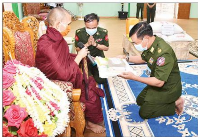
ရေးအထောက်အကူပြုပစ္စည်းများနှင့် လှူဖွယ်ပစ္စည်း များကိုလည်းကောင်း၊ မွန်ပြည်နယ် မော်လမြိုင်မြို့ သုခမေရာမကျောင်းတိုက်နှင့် ဧရာဝတီတိုင်းဒေသ ကြီး ပုသိမ်မြို့ ဓမ္မသုခကျောင်းတိုက်တို့ရှိ သံဃာ တော်များနှင့် သာသနာ့အဖွဲ့ဝင် သီလရှင်များအား နေ့ဆွမ်းများကိုလည်းကောင်း၊ သက်ဆိုင်ရာ တိုင်းစစ်

နေပြည်တော် ဧပြီ ၆ ဘုန်းတော်ကြီးကျောင်းများ၊ သာသနာ့အဖွဲ့ဝင် သီလရှင်ကျောင်းများနှင့် ဘာသာရေးကျောင်းများ တွင် ဆွမ်းအဆင်ပြေစေရေးအတွက် တပ်မတော် (ကြည်းဈေးလေ) အရာရှိ၊ စစ်သည်၊ အရာထမ်း၊ အမှုထမ်းများက တိုင်းစစ်ဌာနချုပ်များအလိုက် မြို့နယ်အသီးသီး၌ ဆွမ်းဆန်တော်၊ ဆီ၊ ဆား၊ ပဲ အမယ် (၄)မျိုးနှင့် လှူဖွယ်ပစ္စည်းများ လှူဒါန်းခြင်း၊ နေ့ဆွမ်းများ ဆက်ကပ်လှူဒါန်းခြင်းနှင့် ကျန်းမာ ရေးစစ်ဆေးမှုများကို ဆောင်ရွက်လျက်ရှိသည်။ ထိုသို့ ဆောင်ရွက်လျက်ရှိရာ ယနေ့တွင် ရှမ်း ပြည်နယ် (အရှေ့ပိုင်း) မိုင်းဆတ်မြို့ မြို့ဦးဘုန်းတော် ကြီးကျောင်း၊ မြို့မဘုန်းတော်ကြီးကျောင်း၊ ဓါတ်စွမ်းဟုန် ဘုန်းတော်ကြီးကျောင်း၊ မိုင်းမြတ်မြို့ တောင်တန်းသာသနာ့ပြု ဘုန်းတော်ကြီးကျောင်း၊ မွန်ပြည်နယ် မော်လမြိုင်မြို့ သုခမေရာမကျောင်း တိုက် (ယာဝု) ရန်ကုန်တိုင်းဒေသကြီး လှည်းကူး မြို့နယ် စရပ်တွင်းကျေးရွာ ကျိုင်းအေးပိကျောင်းတိုက် တို့ရှိ သံဃာတော်များအား ဆွမ်းဆန်တော်၊ ဆီ၊ ဆား၊ ပဲ အမယ် (၄) မျိုး၊ ကိုဗစ်-၁၉ ရောဂါ ကာကွယ်