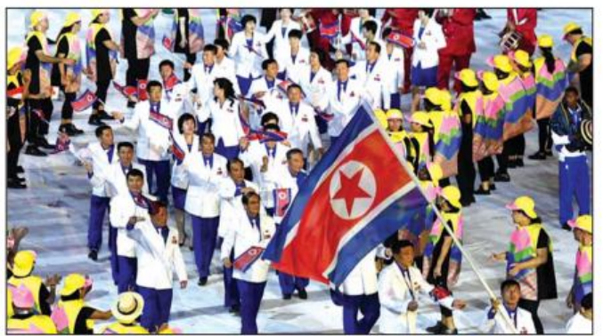
၂၀၁၆ခုနှစ် ဩဂုတ်လတွင်း ရီယိုဒီဂျေးနိုးတွင် ကျင်းပသည့် အားကစားပြိုင်ပွဲသို့ လာရောက်သော မြောက်ကိုရီးယား အားကစားသမားများကို တွေ့ရစဉ်။

မြောက်ကိုရီးယား၏ ကြေညာချက်နှင့် ပတ်သက်ပြီး အသေးစိတ်အချက်အလက်များကို အတည်ပြုဆဲဖြစ်ကြောင်း ပြောကြားခဲ့သည်။ တောင်ကိုရီးယားရှိ ပေါင်းစည်းရေး ဝန်ကြီးဌာနကလည်း အိုလံပစ် အားကစားပြိုင်ပွဲမှ မြောက်ကိုရီးယား နှုတ်ထွက်သွားမှုကို စိတ်မကောင်းဖြစ်ကြောင်း၊ တိုကျို အားကစားပြိုင်ပွဲသည် ကိုရီးယား နှစ်နိုင်ငံကြား ပြန်လည်သင့်မြတ်ရေးနှင့် ငြိမ်းချမ်းရေးကို မြှင့်တင်ရန် ကူညီပေးနိုင်လိမ့်မည်ဟု မျှော်လင့်ထားကြောင်း ပြောကြားခဲ့သည်။ အင်ဒိုအိတ်ချီကေ