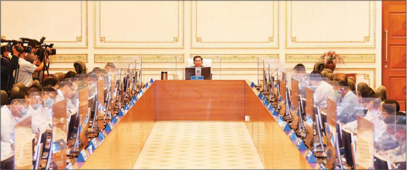
နိုင်ငံတော်စီမံအုပ်ချုပ်ရေးကောင်စီဥက္ကဋ္ဌ တပ်မတော်ကာကွယ်ရေးဦးစီးချုပ် ဗိုလ်ချုပ်မှူးကြီး မင်းအောင်လှိုင် တိုင်းဒေသကြီးနှင့် ပြည်နယ်စီမံအုပ်ချုပ်ရေးကောင်စီဥက္ကဋ္ဌများ၊ ကိုယ်ပိုင်အုပ်ချုပ်ခွင့်ရတိုင်းနှင့် ဒေသ စီမံအုပ်ချုပ်ရေးအဖွဲ့ ဥက္ကဋ္ဌများနှင့်တွေ့ဆုံ၍ တိုင်းဒေသကြီးနှင့် ပြည်နယ်၊ ဒေသဖွံ့ဖြိုးတိုးတက်ရေးဆိုင်ရာကိစ္စရပ်များနှင့် စပ်လျဉ်း၍ ဆွေးနွေးစဉ်။ သတင်းစဉ်