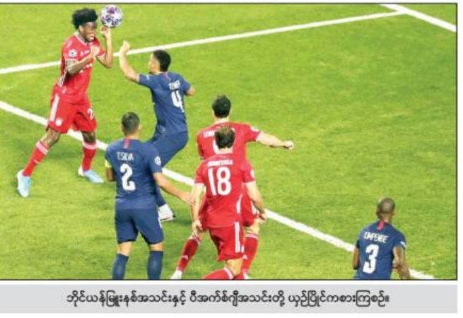
ဘိုင်ယန်မြူးနစ်အသင်းနှင့် ပီအက်စ်ဂျီအသင်းတို့ ယှဉ်ပြိုင်ကစားကြစဉ်။