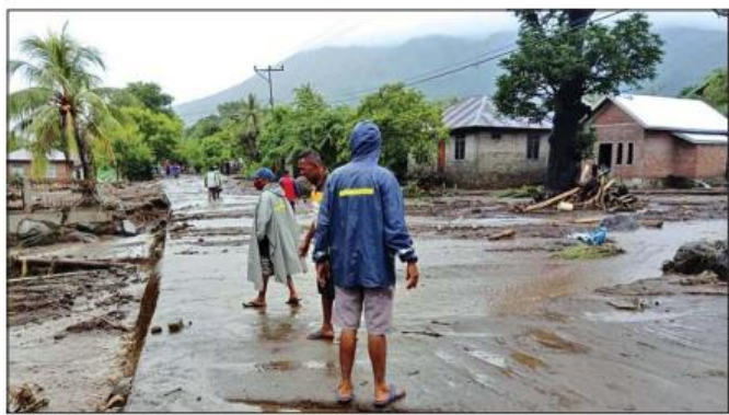
မိုးသည်းထန်စွာ ရွာသွန်းမှုကြောင့် ရေလျှံနေမှုကို တွေ့ရစဉ်။