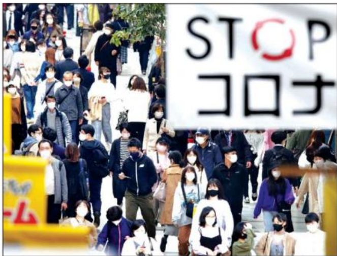
မီယာဂီခရိုင်ရှိ ရှေးဝယ်စင်တာတွင် ပါးစပ်၊ နှာခေါင်းစည်းဝတ်ဆင်ကာ သွားလာနေကြသူများကို တွေ့ရစဉ်။

အဆိုပါခရိုင်တွင် အရေးပေါ်အခြေအနေ ကြေညာမှုကို ဖေဖော်ဝါရီ ၂၈ ရက်တွင် ကြေညာခဲ့ပြီး ယင်းအချိန်မှစတင်ကာ ကိုဗစ် - ၁၉ ကူးစက်ခံရမှုနှုန်းမှာ တဖြည်းဖြည်းချင်း များပြားလာခဲ့သည်။ ခြေရာခံလိုမရသည့် ကူးစက်မှုများ ပေါ်ပေါက်လာပြီးနောက် အိုဆာကာတွင် ဒေသတွင်းကူးစက်မှုများ ဖြစ်ပွားနေသည်ဟု အိုဆာကာ အုပ်ချုပ်ရေးမှူး ယိုရှိမုရာ ဟိရှိမုမိက ပြောသည်။ ကိုဗစ် - ၁၉ ကူးစက်မှုစတုတ္ထအကျော့နှင့် ရင်ဆိုင်ရတော့မည်ဟု ယူဆကြောင်း ၎င်းက ပြောကြားခဲ့သည်။