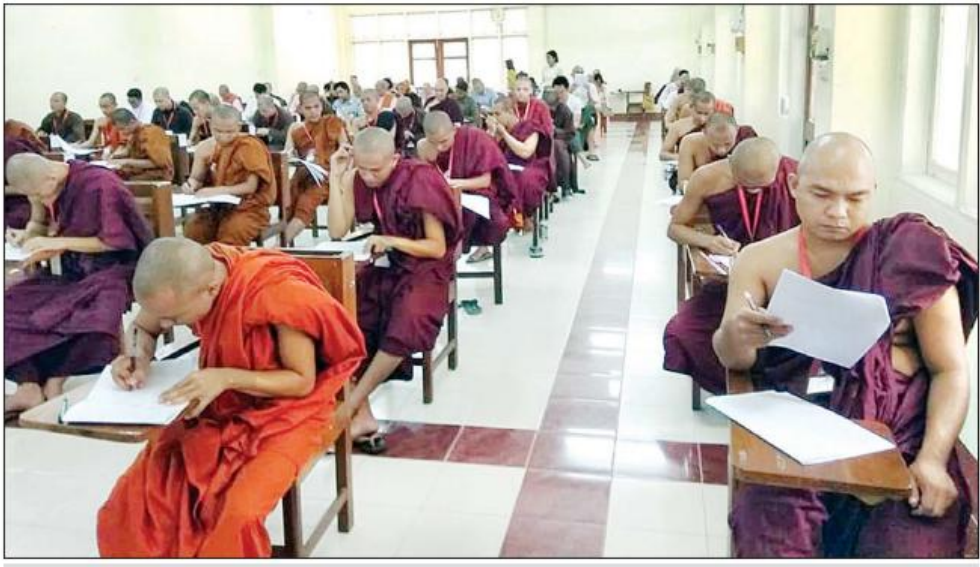
အပြည်ပြည် ဆိုင်ရာ ထေရဝါဒ ဗုဒ္ဓသာသနာပြုတက္ကသိုလ်၌ တက်ရောက်သင်ကြားနေသော သံဃာတော်များ။

ထို့နောက် သင်္ဂဟဗျူဟာ ခြောက်တန်းတင်ထား သော ထေရဝါဒဓမ္မကို ကမ္ဘာအနှံ့ပျံ့နှံ့စေရန် ရည်