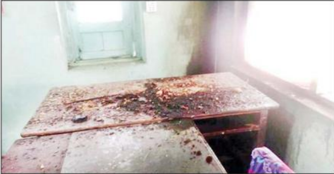
သထုံမြို့ နန်းခဲရပ်ကွက်အုပ်ချုပ်ရေးမှူးရုံးအား မီးပုလင်းဖြင့်ပစ်ခတ်မိခဲ့ပြီးနောက်တွင် တွေ့ရစဉ်။

လုပ်ရပ်များအား အဖွဲ့ငယ်များခွဲ၍ လုပ်ဆောင် ဆူပူအကြမ်းဖက်သူများအနေဖြင့် အကြမ်းဖက် လျက်ရှိရာ ယနေ့တွင်လည်း တိုင်းဒေသကြီး/