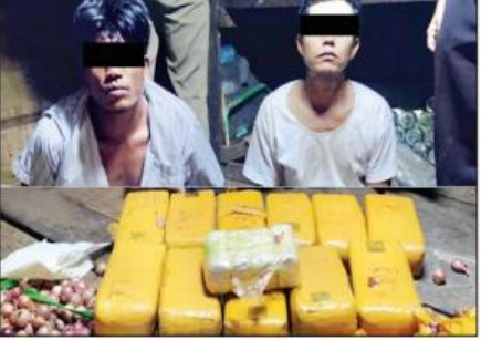
မြိတ်မြို့နယ်၌ မူးယစ်ဆေးဝါးများနှင့်အတူ ဖမ်းဆီးရမိသူနှစ်ဦးကို တွေ့ရစဉ်။

အဆိုပါ ဖမ်းဆီးရမိသူများနှင့် မူးယစ်ဆေးဝါးများအား သက်ဆိုင်ရာ သို့ စနစ်တကျလှုံ့ပြောင်းအပ်နှံသွားမည်ဖြစ်ကြောင်း သတင်းရရှိသည်။ သတင်းစဉ်