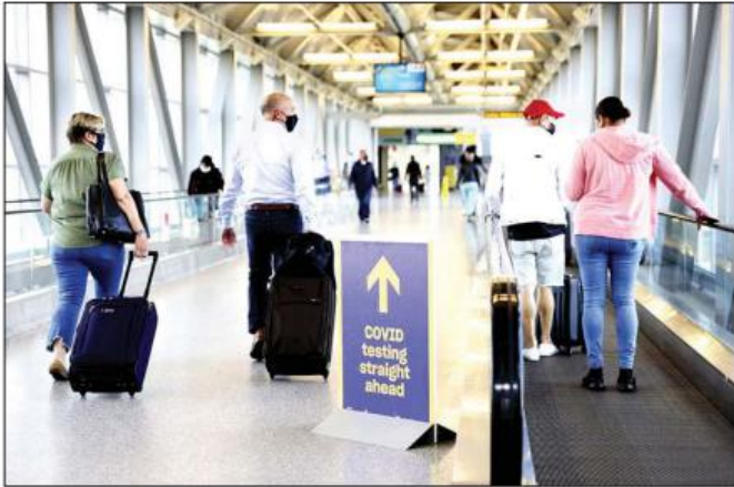
ပါးစပ်၊ နှာခေါင်းစည်းတပ်ဆင်ထားသည့် ခရီးသွားများကို တွေ့ရစဉ်။