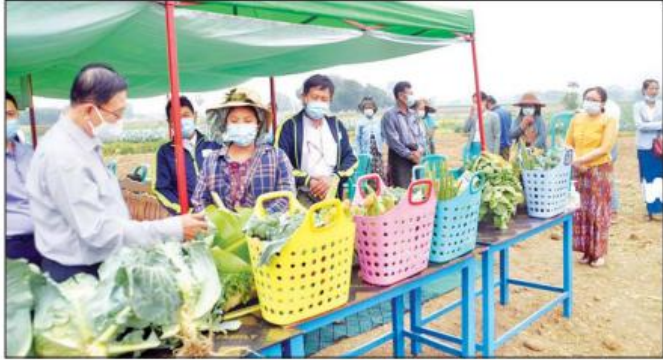
အသင်းအနေဖြင့် အသင်းသားပိုင် စိုက်ပျိုးမြေဧက ၁၇၀ တွင် ဂေါ်ဖီ၊ ပြောင်းပွေး၊ ပန်းမုန့်လာ၊ မုန့်လာဥ၊ ငရုတ်၊ ခရမ်းသီးတို့ စိုက်ပျိုး ထုတ်လုပ်လျက်ရှိပြီး China EXIM Bank ပံ့ပိုးချေးငွေဖြင့် အသင်းသား များအတွက် စိုက်ပျိုးစရိတ်ကို နှင့် ရန်ကုန်တိုင်းဒေသကြီးများ အတိုးနှုန်းချိုသာစွာ ထုတ်ပေး သို့ တင်ပို့ရောင်းချနေကြရမှု အပေါ် ဝန်ကြီးဌာနအနေဖြင့် ပိုမိုကောင်းမွန်သော အစီအမံ ဒေသခံ သီးနှံပွဲစားများမှတစ်ဆင့် မွန်ပြည်နယ်၊ ကရင်ပြည်နယ် ကြောင်း သိရသည်။ သတင်းစဉ်