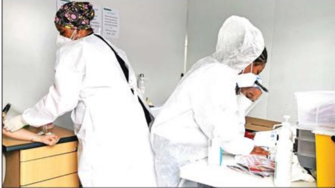
တောင်အာဖရိကနိုင်ငံရှိ ဆေးဘက်ဆိုင်ရာဝန်ထမ်းများကို တွေ့ရစဉ်။

သဘောတူညီမှုအရ ဂျွန်ဆင်အင်န်ဂျွန်ဆင်သည် အာဖရိကသမဂ္ဂ အဖွဲ့ဝင်နိုင်ငံများအတွက် ကိုဗစ်-၁၉ ကာကွယ်ဆေး သန်း ၂၅၀ ကို ထောက်ပံ့ပေးမည်ဖြစ်ပြီး နောက်ထပ် ကာကွယ်ဆေး သန်း ၁၀၀ ဝယ်ယူမည်ဖြစ်သည်။