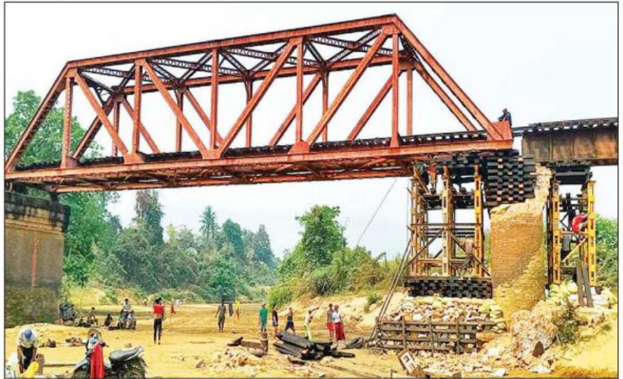
မန္တလေး-မြစ်ကြီးနား ရထားလမ်းပိုင်းရှိ တံတားအမှတ် (၄၀၅) သဲချောင်းတံတား ယာယီပြုပြင်ပြီးစီးမှုကို တွေ့ရစဉ်။

ရွာထောင်မှ တာဝန်ခံအင်ဂျင်နီယာမှူးဦးစိုး၍ တံတားအဖွဲ့ လုပ်သားများ အငယ်တန်းအင်ဂျင်နီယာ(၁) ကောလင်းဦးစိုး၍ သဲလမ်း လုပ်သားများ ပြင်ပလုပ်သားများသည် မတ် ၁၅ ရက်မှ ၂၄ ရက်အတွင်း အခက်အခဲများကြားမှ လုပ်ငန်းဆောင်ရွက်မှု ၁၀၀ ရာခိုင်နှုန်း ဆောင်ရွက်ပြီးစီးခဲ့ပြီးဖြစ်ကြောင်းနှင့် တံတားအမှတ်(၄၀၅)ကို ယာယီ ပြုပြင်ခြင်းလုပ်ငန်းများအားလုံး မတ် ၂၅ ရက်တွင် ဆောင်ရွက်ပြီးစီးပြီ ဖြစ်၍ အစုန်/အဆန်ရထားများ လုံခြုံစိတ်ချစွာ ဖြတ်သန်းမောင်းနှင် နိုင်ပြီဖြစ်ကြောင်း သိရသည်။ စာမျက်နှာ ၅ ကော်လံ ၅