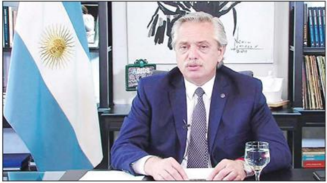
အာဂျင်တီးနားသမ္မတ အယ်လ်ဘာတို ဖာနန်ဒက်။

အခြေအနေများလည်း ကောင်းမွန်လျက်ရှိကြောင်း သမ္မတက ပြောကြားလိုက်သည်။ မိမိတို့အနေဖြင့် အလွန်သတိထားနေထိုင် ရမည်ဖြစ်ကြောင်း၊ လက်ရှိ ကိုဗစ်-၁၉ ကပ်ရောဂါ ဆိုင်ရာ လမ်းညွှန်ချက်များကို လိုက်နာပြီးနောက် လူတိုင်း လူတိုင်း မိမိကိုယ်မိမိ ၎င်းတို့ကောင်းမွန်စွာ စောင့်ရှောက်ကြရန် လိုအပ်ကြောင်း သမ္မတက ဆက်လက်ပြောကြားသည်။ ကိုဗစ်-၁၉ ကပ်ရောဂါ ပြီးဆုံးခြင်းမရှိသေးသလို ကို ပြသလျက်ရှိကြောင်း၊ မိမိတို့ကိုယ်တိုင် မိမိတို့ ကာကွယ်မှုများ ဆက်လက်ပြုလုပ်ရန် လိုအပ်ကြောင်း သမ္မတက ထပ်လောင်းပြောကြားသည်။ အာဂျင်တီးနားနိုင်ငံတွင် သောကြာနေ့က ကိုဗစ်-၁၉ ကူးစက်ဖြစ်ပွားသူ ၉၉၀ ဦး တိုးလာမှုနှင့် အတူ နိုင်ငံအတွင်း စုစုပေါင်း ကိုဗစ်-၁၉ ကူးစက် ဖြစ်ပွားသူပေါင်း ၂၃၇၃၃၂ ဦး တိုးလာကြောင်း