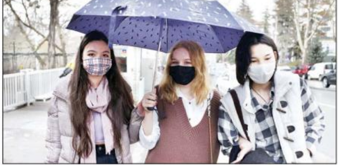
တူရုက်နိုင်ငံမြို့တော် အင်ကာရာတွင် အမျိုးသမီးများ ပါးစပ်၊ နှာခေါင်းစည်းတင်ဆင်ပြီး မိုးရွာထဲတွင် လမ်းလျှောက်နေသည်ကို တွေ့ရစဉ်။

ကိုဗစ်-၁၉ ကပ်ရောဂါကြောင့် သေဆုံးသူပေါင်းမှာလည်း ၃၁၈၅၂ ဦးအထိ ရောက်ရှိလာသည်။ လတ်တလောတွင် ကိုဗစ်-၁၉ အရေးပေါ်အခြေအနေ ဖြစ်နေသူ ၂၈၅၂ ဦး ရှိသည်။ မတ်လက နေ့စဉ် ကိုဗစ်-၁၉ ကူးစက်ဖြစ်ပွားသူ အရေအတွက်သည် ၁၀၀၀၀ အောက် ကျဆင်းခဲ့သည်။ လွန်ခဲ့သော နိုဝင်ဘာလက ကိုဗစ်-၁၉ ဒုတိယအကြိမ် ရိုက်ခတ်ချိန်တွင် ချမှတ်ခဲ့သော ကန့်သတ်ချက်များကို လျော့ပေါ့ပေးခဲ့သလို စားသောက်ဆိုင်၊ ကော်ဖီဆိုင်နှင့် လက်ဖက်ရည်ဆိုင်များကိုသို့သော စီးပွားရေးလုပ်ငန်းများကို ပြန်လည်ဖွင့်လှစ်ပေးခဲ့သည်။ သို့သော်လည်း ပုံမှန်လုပ်ငန်းစဉ်များကို ယခုအခါတွင် ထိန်းချုပ်ကန့်သတ်ချက်မရှိ ဖြစ်သည်။ ဇန်နဝါရီ ၄ ရက်က တူရုက်နိုင်ငံတွင် ကိုဗစ်-၁၉ ကာကွယ်ဆေးထိုးမှု အစီအစဉ် စတင်ခဲ့ပြီး ကိုဗစ်-၁၉ ကူးစက်မှုပေါင်း ၁ ဒသမ ၁ သန်း ထိုးပေးနိုင်ခဲ့ကြောင်း တရားဝင်စာရင်းစာယာဇော်အရ သိရသည်။ နိုင်ငံအတွင်း လူပေါင်း ၈၃ သန်းတွင် ၉ ဒသမ