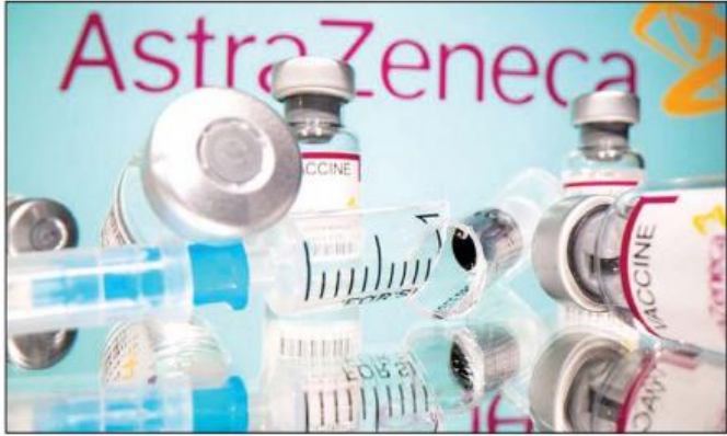
အက်စ်ထရာဇီကာ ကာကွယ်ဆေး။