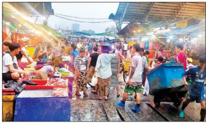
ရန်ကုန်မြို့တွင်း ပြန်လည်တည်ငြိမ်အေးချမ်း လာပြီဖြစ်၍ စည်ပင်သာယာရေးများကိုယ်ပိုင်ဈေး Shopping Mall Plaza များ၊ အိမ်ဆိုင်များမှာ ဈေးရောင်း၊ ဈေးဝယ်သူများဖြင့် ပြန်လည် စည်ကားလျက်ရှိရာ လှိုင်သာယာမြို့နယ် ပင်လုံဈေးတွင် ပြည်သူများ စိတ်အေးချမ်းသာစွာ ဈေးရောင်း၊ ဈေးဝယ်လျက်ရှိသည်ကို မြင်တွေ့ရစေ။ သတင်းစဉ်

နေပြည်တော် ဧပြီ ၃ - ရှမ်းပြည်နယ်မြောက်ပိုင်း ကုန်းကြမ်းမြို့နယ်အတွင်း လုံခြုံရေးဆောင်ရွက်လျက်ရှိသော ပူးပေါင်းအဖွဲ့သည် ယနေ့နံနက်ပိုင်းတွင် ညီညွတ်ကျေးရွာ၏ အနောက်တောင်ဘက် မိတာ ၄၀၀ ခန့်အကွာသို့ အရောက်၌ မူးယစ်ဆေးဝါးများနှင့် ပစ္စည်းများကို သိမ်းဆည်းရမိခဲ့သည်။ သိမ်းဆည်းရမိခဲ့သည့် ဆာဗီဇာ ၁၁ ခွက်၊ ၁၁၀ ဂရမ်ခန့် (ခန့်မှန်းတန်ဖိုးငွေကျပ် ၁၆ သိန်းကျော်)ကို တွေ့ရှိသိမ်းဆည်းရမိခဲ့သည်။ အဆိုပါ သိမ်းဆည်းရမိ မူးယစ်ဆေးဝါးများကို လောကီကိုင်း မူးယစ်တပ်ဖွဲ့စုနှင့် စနစ်တကျ လွှဲပြောင်းအပ်နှံသွားမည်ဖြစ်ကြောင်း သတင်းရရှိသည်။ သတင်းစဉ်