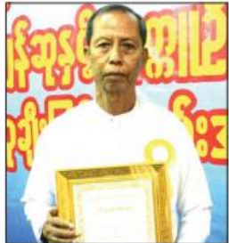
မောင်ငြိမ်းရည်(မင်းကင်း)

စာပေလောကသို့ ဝင်ရောက်ခဲ့ခြင်းဖြစ် ကာ ၁၉၆၈ ခုနှစ်တွင် "ရောင်နီဦး ကလေး ကဗျာများ"နှင့် ၁၉၇၈ ခုနှစ်တွင် "မြသား နီလာကဗျာများ"စာအုပ်တို့ဖြင့် အမျိုးသား စာပေဆု ရရှိခဲ့သည်။ အလားတူ စာပေ လည်း ရရှိခဲ့ခြင်းဖြစ်ကာ စာပေကျမ်းဂန် လည်း ရရှိခဲ့ခြင်းဖြစ်ကာ စာပေကျမ်းဂန် အမည်ရင်း- ဦးငြိမ်း ကလောင်အမည်- မောင်ငြိမ်းရည်(မင်းကင်း) ကဗျာပေါင်းချုပ်(ဒုတိယဆု) "ချင်းတွင်းဒေသအလှမြေ ကဗျာများ"