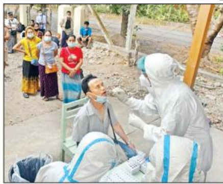
သတင်းစဉ်

နေပြည်တော် ဧပြီ ၃ ပြည်ပမှ ပြန်လည်ဝင်ရောက်လာသည့် မွန်ပြည်နယ်နှင့် ကရင်ပြည်နယ်အတွင်းရှိ ဒေသခံပြည်သူများအား COVID-19 ရောဂါနှင့်ပတ်သက်၍ လိုအပ်သည့်ကျန်းမာရေးစစ်ဆေးမှုများ ပြုလုပ်ရန် အခက်အခဲဖြစ်ပေါ်လျက်ရှိသဖြင့် မော်လမြိုင်မြို့ရှိ တက္ကသိုလ် (၁၀)မြို့နယ် အဆောင်၌ Quarantine ထားရှိခဲ့သည်။ ထိုသို့ Quarantine ထားရှိသည့် ပြည်ပမှ ပြန်လည်ဝင်ရောက်လာသူ ၃၇ ဦးကို ယနေ့နံနက်ပိုင်းတွင် အရှေ့တောင်တိုင်းစစ်ဌာနချုပ်၊ နယ်မြေခံတပ်မတော်ဆေးရုံမှ ဆရာဝန်များ၊ ပါရဂူများ၊ ဆေးမှူးများနှင့် သူနာပြုများက မြို့နယ်စီမံအုပ်ချုပ်ရေးအဖွဲ့ အဖွဲ့ဝင်များ၊ လူမှုရေးအသင်းအဖွဲ့များနှင့် ပူးပေါင်း၍ နှာခေါင်းတို့ဖတ်၊ အာခေါင်းတို့ဖတ်ရယူခြင်း၊ RDT နည်းဖြင့် စစ်ဆေးခြင်းများကို ဆက်လက် ဆောင်ရွက်ပေးခဲ့ကြောင်း သတင်းရရှိသည်။ (အောက်ပုံ)