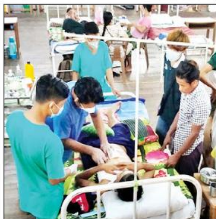
အပြင် ဆေးရုံတက်လူနာများနှင့် လူနာစောင့်ရှောက်ရေးအဖွဲ့ဝင်များ အဆင်ပြေစေရန်အတွက်ပါ စီမံဆောင်ရွက်ပေးလျက်ရှိကြောင်း သတင်းရရှိသည်။ သတင်းစဉ်

ကလေးမီးဖွားလူနာ ၂၈၄၅ ဦးကို ခွဲစိတ်မွေးဖွားပေးနိုင်ခဲ့ကာ ဦးရေ ၄၃၆၀ ကို သမန်မွေးဖွားပေးနိုင်ခဲ့ခြင်းကြောင့် ယနေ့အထိ ကလေးငယ် ၅၂၅၅ ဦးကို အောင်မြင်စွာ မွေးဖွားပေးနိုင်ခဲ့သည်။ စီမံဆောင်ရွက်ပေး တပ်မတော်အနေဖြင့် ပြည်သူ့လူထု၏ ကျန်းမာရေးစောင့်ရှောက်မှုလုပ်ငန်းများအား ထိရောက်စွာ ဆောင်ရွက်နိုင်ရန်အတွက် ပါရဂူများ၊ ဆေးမှူးများ၊ သူနာပြုများဖြင့် ကျန်းမာရေးစစ်ဆေးပေးခြင်း၊ ခွဲစိတ်ရန် လိုအပ်သည့် လူနာများအား ခွဲစိတ်ပေးခြင်း၊ ဆေးရုံတက်ရောက်ကုသရန် လိုအပ်သော လူနာများကို ဆေးရုံတင်ကာ ကျန်းမာရေးစောင့်ရှောက်ပေးခြင်းများ ဆောင်ရွက်ပေးသည့်