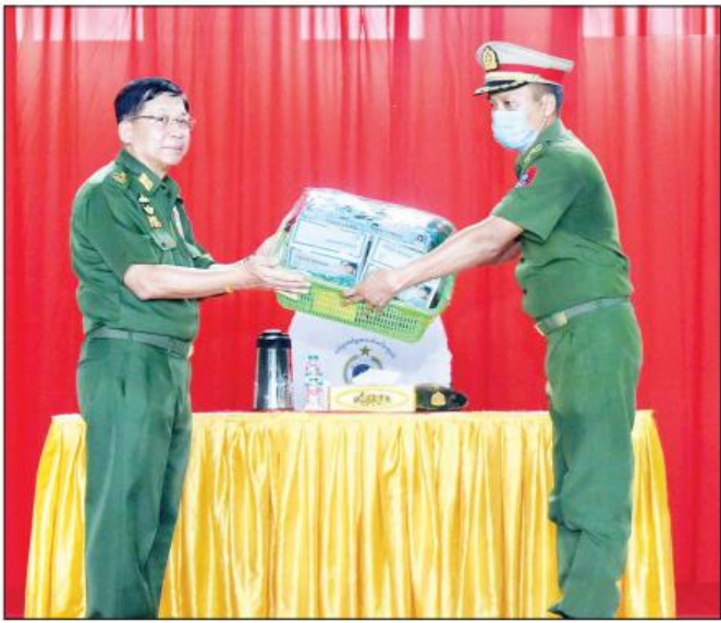
နိုင်ငံတော်စီမံအုပ်ချုပ်ရေးကောင်စီဥက္ကဋ္ဌ၊ တပ်မတော်ကာကွယ်ရေးဦးစီးချုပ် ဒိုလ်ချုပ်မှူးကြီး မင်းအောင်လှိုင် စားသောက်ပွယ်ရာပစ္စည်းများနှင့် တပ်မတော်စက်ရုံထုတ် လှည်းကုန်ပစ္စည်းများကို တာဝန်ရှိသူတစ်ဦးထံ ပေးအပ်စဉ်။

ဒီမိုကရေစီစနစ်တွင် ရွေးကောက်ပွဲသည် အနှစ်သာရတစ်ခုဖြစ်ပြီး မိမိတို့နိုင်ငံ၌ ၂၀၁၀ ပြည့်နှစ် ရွေးကောက်ပွဲတွင် မဲပေးခွင့်ရှိသူ၏ ၇၇ ရာခိုင်နှုန်း မဲပေးခဲ့ကြကြောင်း၊ ၂၀၁၅ ခုနှစ် ရွေးကောက်ပွဲတွင် ၇၀ ရာခိုင်နှုန်းခန့်ပဲ မဲပေးခဲ့ကြသည်ကို တွေ့ရ ကြောင်း၊ ၂၀၁၀ ခုနှစ်တွင် တက်လာသည့်အစိုးရ သည် အတိုင်းအတာတစ်ခုအထိ အောင်နိုင်အောင် လုပ်ဆောင်နိုင်ခဲ့သော်လည်း အခက်အခဲမျိုးစုံဖြင့် ရင်ဆိုင်ခဲ့ရကြောင်း၊ ၂၀၁၇ ခုနှစ် ရွေးကောက်ပွဲ တွင် အစိုးရသစ်တစ်ရပ်တက်လာခဲ့ပြီး ၅ နှစ်တာ သက်တမ်းအုပ်ချုပ်ခဲ့ရာတွင် အစိုးရ၏လုပ်ဆောင်