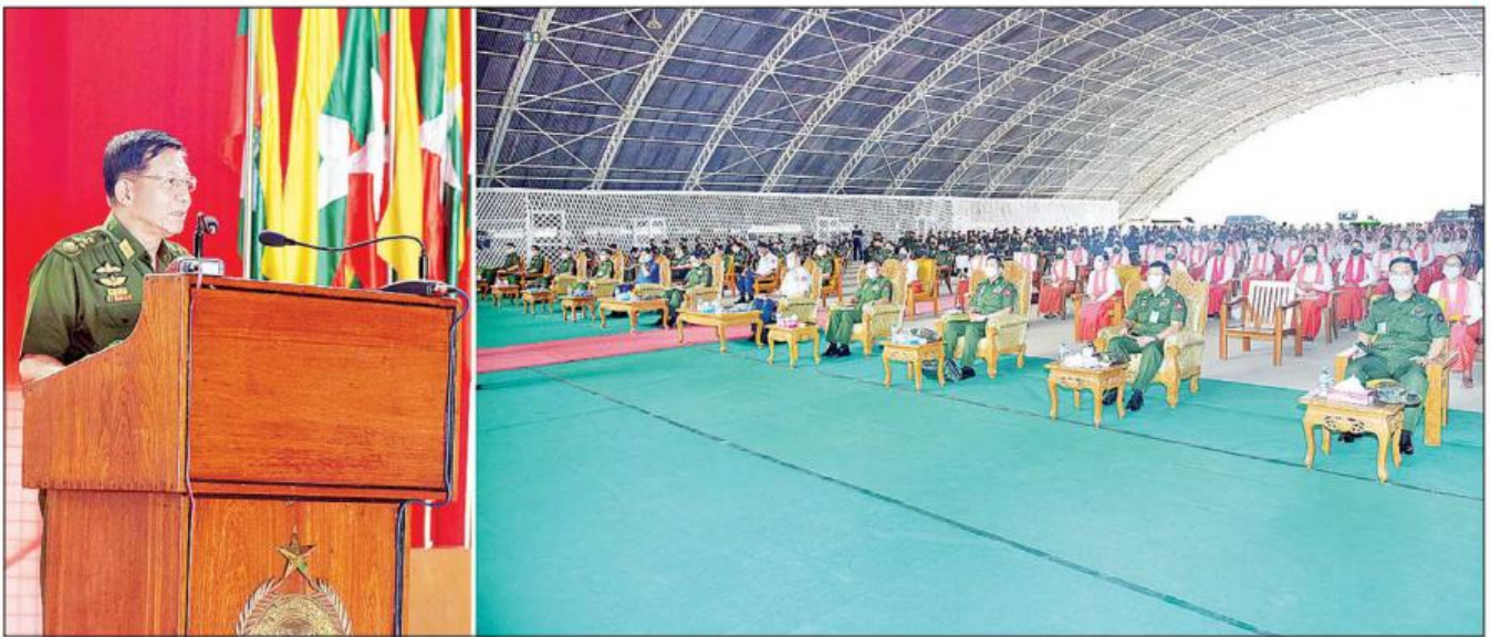
နိုင်ငံတော်စီမံအုပ်ချုပ်ရေးကောင်စီဥက္ကဋ္ဌ၊ တပ်မတော်ကာကွယ်ရေးဦးစီးချုပ် ဗိုလ်ချုပ်မှူးကြီး မင်းအောင်လှိုင် မိတ္ထီလာတပ်နယ်မှ အရာရှိ၊ စစ်သည်၊ မိသားစုများအား တွေ့ဆုံအမှာစကား ပြောကြားစဉ်။ သတင်းစဉ်