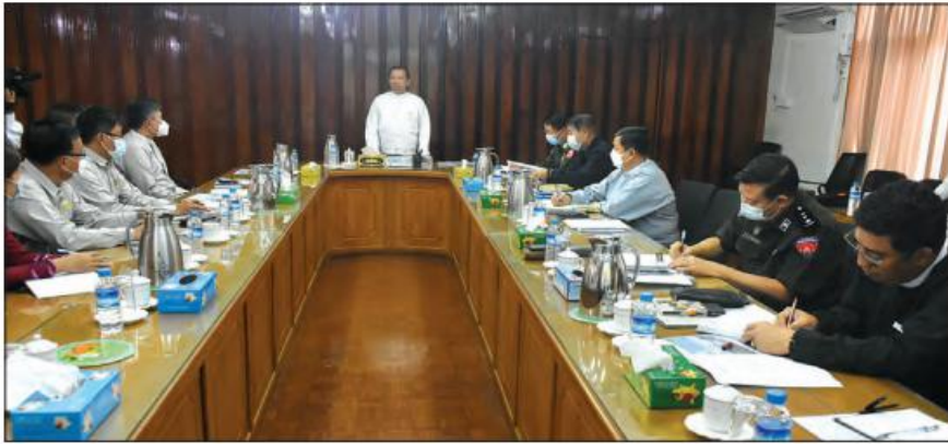
ရန်ကုန်တိုင်းဒေသကြီး စီမံအုပ်ချုပ်ရေးကောင်စီဥက္ကဋ္ဌ ဦးလှစိုး ရန်ကုန်တိုင်းဒေသကြီးအတွင်းရှိ ဆောက်လုပ်ရေး စီမံကိန်း ကြီးများ အချိန်မီပြီးစီးရေး သက်ဆိုင်ရာဌာနများမှ တာဝန်ရှိသူများနှင့် တွေ့ဆုံဆွေးနွေးပွဲတွင် အမှာစကားပြောကြားစဉ်။

ဆွေးနွေးပွဲတွင် လမ်းဦးစီးဌာန၊ စီမံကိန်း ကြီးကြပ်ကွပ်ကဲရေးအဖွဲ့၊ အင်ဂျင်နီယာချုပ် ဦးအောင်မျိုးဦးက မဟာမဲခေါင်ဒေသတွင်း လမ်းမကြီးများ အဆင့်မြှင့်တင်ရေး စီမံကိန်းများတွင် ပါဝင်သည့် ရန်ကုန်-မန္တလေး အမြန် လမ်းမကြီး၊ လမ်းအန္တရာယ်ကင်းရှင်းရေး အဆင့်မြှင့်တင်ခြင်းလုပ်ငန်း၊ ရန်ကုန်-ပုသိမ်လမ်း Detailed Design ဆောင်ရွက် ခြင်း၊ ပဲခူး-ကဝ-ခရမ်း-သုံးခွ-သန်လျင် လမ်းမကြီး အဆင့်မြှင့်တင်ခြင်းလုပ်ငန်း များ၊ တံတားဦးစီးဌာန၊ အင်ဂျင်နီယာ ချုပ်ကြီးထွန်းလင်းက ပဲခူးမြစ်ကူး သန်လျင် တံတားအမှတ် (၃) ၏ သန်လျင်ဘက် အခြမ်း၊ သာကေတဘက်အခြမ်းနှင့် ရေလယ်လုပ်ငန်းများတွင် အဖွဲ့သုံးဖွဲ့ခဲ့၍ တည်ဆောက်နေမှု အခြေအနေ