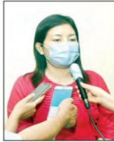
မထိုက်ထိုက်ထွန်း