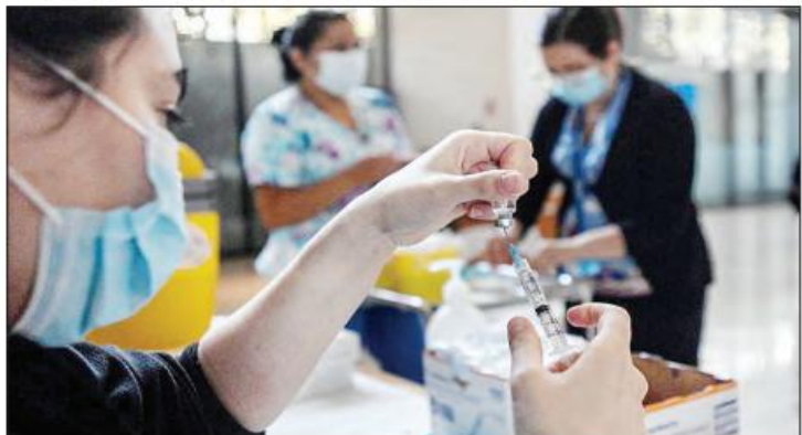
ချိုလီနိုင်ငံ ဆန်တီယာဂိုတွင် သူနာပြုတစ်ဦး ကိုဗစ်-၁၉ ကာကွယ်ဆေးထိုးရန် ပြင်ဆင်နေသည်ကိုတွေ့ရစဉ်။

တစ်ချိန်တည်းမှာပင် ညမထွက်ရအမိန့်ကို နောက်ထပ် တစ်နာရီ ထပ်တိုးလိုက်ပြီး ည ၉ နာရီအထိ သတ်မှတ်လိုက်သလို တစ်ဦးချင်း ခရီးသွားလာခွင့်ပြုမှုနှင့် ပတ်သက်ပြီး သီးသန့်ကန့်သတ်စောင့်ကြည့်မှု ခံယူနေရသည့်မြို့များသို့ တစ်ပတ်နှစ်ကြိမ်အထိသာ သွားလာရန် ကန့်သတ်လိုက်ကြောင်း သိရသည်။ ထို့အပြင် စနေနေ့မှစကာ နောက်ထပ် မြို့ပေါင်း ၁၉ မြို့ကိုလည်း သီးသန့်ကန့်သတ် စောင့်ကြည့်မှု စာရင်းထဲ ထည့်သွင်းမည် ဖြစ်သလို လူသီးသန့်ကျပ်လည်း ကန့်သတ်စောင့်ကြည့်မှု ခံထားရကြောင်း သိရသည်။ ဆင်ဟွာ