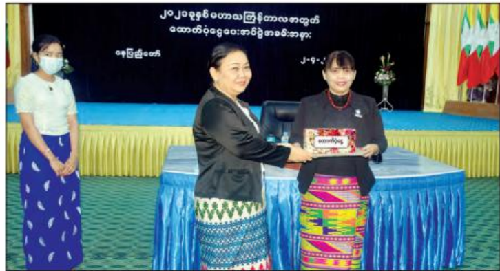
၂၀၂၁ ခုနှစ် မဟာသင်္ကြန်ကာလအတွက် ထောက်ပံ့ငွေပေးအပ်ပွဲအခမ်းအနား

တက်ရောက်လာသည့် အမျိုးသား အကောင်အထည်ဖော် ဆောင်ရွက်သွားမည့် လုပ်ငန်းစဉ်များကို ရှင်းလင်းတင်ပြဆွေးနွေးခဲ့ကြပြီး အမျိုးသားအဆင့်ကော်မတီဥက္ကဋ္ဌ တာဝန်ရှိသူအသီးသီးက မိမိတို့ ကဏ္ဍအလိုက် ဆောင်ရွက်ထား နယ်စပ်ရေးရာ ဝန်ကြီးဌာန ပြည်ထောင်စုဝန်ကြီး ဒုတိယ