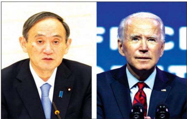
ဂျပန်ဝန်ကြီးချုပ် ဆူဂါနိုနှင့် အမေရိကန်သမ္မတ ဂျိုးဘိုင်ဒင်။

ကပ်ရောဂါကိုင်တွယ်ဖြေရှင်းမှုများ အင်ဒို-ပစိဖိတ်ဒေသ လွတ်လပ်စွာကုန်သွယ်မှုနှင့် အခြားသော ပြဿနာရပ်များကိုလည်း အတူဖြေရှင်းသွားနိုင်ရန် အခွင့်အရေးရမည်ဟု ကာတိုက ပြောသည်။ ကနဦးက ဂျပန်အစိုးရသည် အမေရိကန်နှင့် တွေ့ဆုံပွဲကို ဧပြီလဝက်တွင် ပြုလုပ်သွားမည်ဟု ပြောကြားခဲ့ပြီးနောက် ဧပြီ ၉ ရက်တွင် တွေ့ဆုံပွဲပြုလုပ်မည်ဟု အစိုးရသတင်းအရင်းအမြစ်အချို့က အကြံပြုပြောကြားခဲ့သည်။ ဂျပန်ဝန်ကြီးချုပ် ဆူဂါနိုသည် ခရီးစဉ်မစတင်မီ ဖိုက်စာ ကိုဗစ်-၁၉ ကာကွယ်ဆေးထိုးနှံခဲ့သည်။