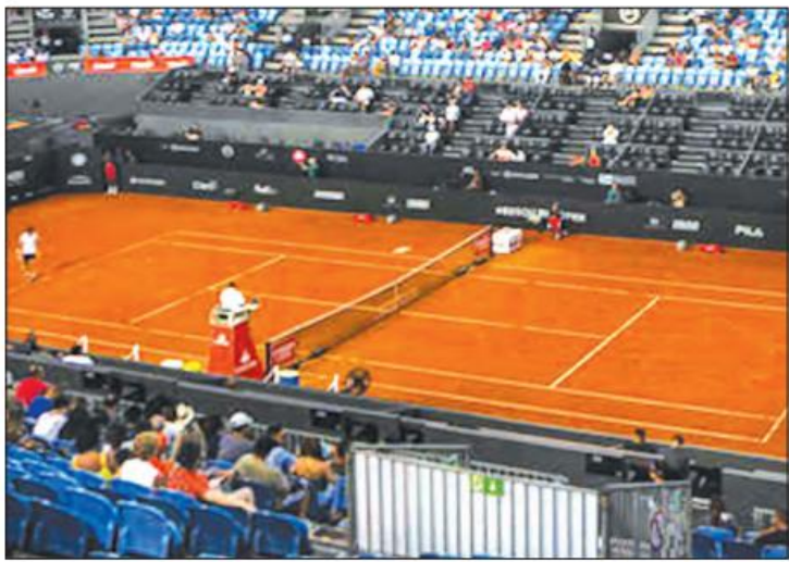
၂၀၂၀ ပြည့်နှစ်က ကျင်းပခဲ့သည့် ရီယိုအိုးပင်းတင်းနစ်ပြိုင်ပွဲ။