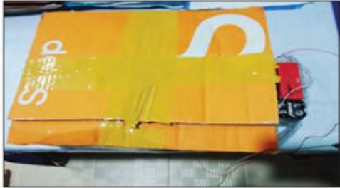
သယံဇာတကျွန်းမြို့ ဆူပူအကြမ်းဖက်မှုမှ ဒေသန္တရလက်လုပ် ချိန်ကိုက် ဖုံးတစ်လုံးကို တွေ့ရစဉ်။