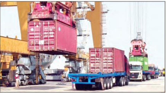
သွင်းကုန်/ထုတ်ကုန်လုပ်ငန်းများ ပုံမှန်ဆောင်ရွက်နေမှု

အဆင့်လိုက် တားဆီးနှိမ်နင်းခဲ့ပါသည်။ မင်းမဲ့စရိုက်ဖြင့် ဆူပူအကြမ်းဖက်မှုများသည် မည်သည့်နိုင်ငံကမျှ လက်ခံနိုင်သည့် လုပ်ဆောင်မှုများမဟုတ်သည်ကို တွေ့ရှိရမည်ဖြစ်သည်။ မတ်လ ပထမပတ်နေ့ကပိုင်းတွင် လက်နက်ကိုင်အကြမ်းဖက် တုံ့ပြန်မှုအသွင် (Insurrection with arms) ဖြစ်လာခဲ့သည်။ ထို့ကြောင့် ဥပဒေနှင့်အညီ နှိမ်နင်းခဲ့ရပါသည်။ ထိုကဲ့သို့ NLD နှင့် NLD လိုလားသူများက ဆန္ဒပြမှုမှသည် လက်နက်ကိုင်အကြမ်းဖက် တုံ့ပြန်မှုအသွင်ပြောင်းလာခဲ့သည်ကို ဖော်ပြခြင်းမရှိဘဲ တစ်ဖက်သတ်စွန့်စွဲ ပြောကြားမှုများသည် တရားနည်းလမ်းကျမရှိကြောင်း တွေ့ရှိရသည်။ တစ်နိုင်ငံလုံးက NLD ကို ထောက်ခံခြင်းမဟုတ်သည်ကို စာရင်းစယားများအရ NLD နှင့် ထောက်ခံသူများ၏ လှုံ့ဆော်မှုကြောင့် တစ်နိုင်ငံလုံးဆန္ဒပြခဲ့သည်ဆိုသော ၂၄ ငါးလုံးနေ့ (၂၂-၂-၂၀၂၁) ၌ပင် တစ်နိုင်ငံလုံး လူဦးရေ၏ ၉ ရာခိုင်နှုန်းခန့်သာရှိသည်ကို တွေ့ရှိရမည်ဖြစ်သည်။ ယင်းအခြေအနေကို မီဒီယာများ၏ အကူအညီဖြင့် ပုံကြီးချဲ့နေခြင်းသာဖြစ်ပါသည်။