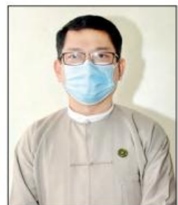
အမြဲတမ်းအတွင်းဝန် ဦးမင်းမင်း