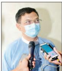
ဒုတိယဝန်ကြီး ဦးညွန့်အောင်

ဒုတိယဝန်ကြီး ဦးညွန့်အောင် ကုန်သွယ်မှုနှင့် ကုန်စည်စီးဆင်းမှုများ မှန်ကန်မြန်ဆန်စေရေး လုပ်ငန်းကော်မတီဥက္ကဋ္ဌ စီးပွားရေးနှင့် ကူးသန်းရောင်းဝယ်ရေးဝန်ကြီးဌာန