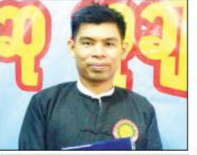
နွေကုံကော် (မြို့လှ)

အမည်အရင်း - ဗိုလ်ကြီးစိုးမိုးကျော် ကလောင်အမည်- နွေကုံကော် (မြို့လှ) ဝတ္ထုရှည် (ပထမဆု) “မော်စကိုမှာ ဝေတဲ့နှင်း”