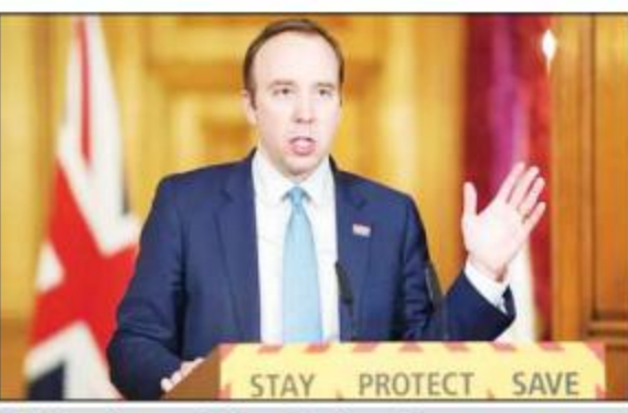
ပြိတိုန်ကျန်းမာရေးဝန်ကြီး မက်ဟန်ကော့ခ်။

ကိုဗစ်-၁၉ ကန့်သတ်ချက် များ လျော့ချလိုက်ပြီး ၄၈ နာရီ ကြာပြီးနောက် မတ် ၃၀ ရက်က ပြည်သူများသည် ပန်းခြံများနှင့် ကမ်းခြေများတွင် စုဝေးခဲ့ကြ သည်။ မိမိတို့အနေဖြင့် အနည်းဆုံး နှစ်မိတာအကွာတွင် ရှိနေရန်လို