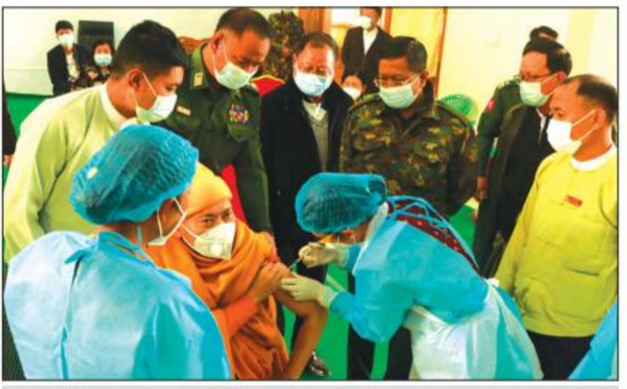
ဟားခါးမြို့၌ ကိုဗစ်-၁၉ ရောဂါကာကွယ်ဆေး ထိုးနှံပေးနေစဉ်။

ဟားခါး မတ် ၃၁ ချင်းပြည်နယ် စီမံအုပ်ချုပ်ရေးကောင်စီက ဦးဆောင်ပြုလုပ်သည့် သံဃာတော်များ၊ ဘာသာရေး ခေါင်းဆောင်များ၊ နိုင်ငံ့ဝန်ထမ်းများနှင့် မိသားစုဝင်များ၊ အသက် ၆၀ နှစ်နှင့်အထက် ရှိသူများအား ကိုဗစ်-၁၉ ရောဂါ ကာကွယ်ဆေး ထိုးနှံခြင်းကို မတ် ၃၀ ရက်က ဟားခါးမြို့ ချင်းပြည်နယ်စီမံအုပ်ချုပ်ရေးကောင်စီ ရုံးနှင့် မြို့တော်ခန်းမ၌ ကျင်းပရာ ပြည်နယ်စီမံအုပ်ချုပ်ရေးကောင်စီ ဥက္ကဋ္ဌ ဦးဌန့်ဆန်းအောင်၊ အနောက်မြောက်တိုင်းစစ်ဌာနချုပ် ဒုတိယတိုင်းမှူး ဗိုလ်မှူးချုပ် မျိုးထွဋ်လှိုင်၊ ပြည်နယ်တရားလွှတ်တော် တရားသူကြီးချုပ် ဦးဝင်းမြင့်ကျော်၊ ပြည်နယ်စီမံအုပ်ချုပ်ရေးကောင်စီ အတွင်းရေးမှူးနှင့် ကောင်စီဝင်များ၊ တာဝန်ရှိသူများက ကြည့်ရှုအားပေးသည်။