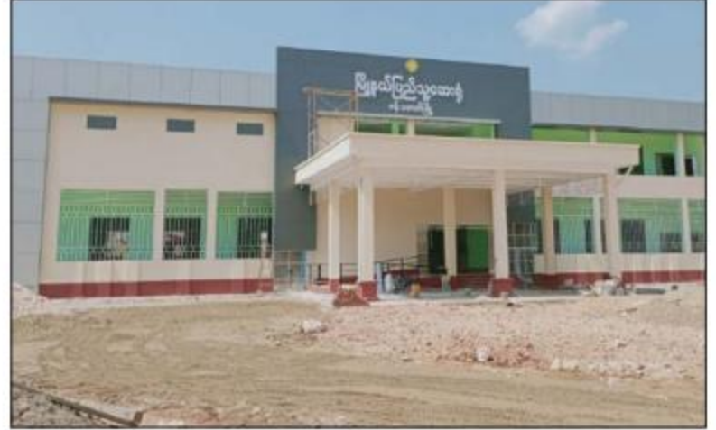
ဗန်းမောက်မြို့ မြို့နယ်ပြည်သူ့ဆေးရုံ တိုးချဲ့နှစ်ထပ်ဆောင်။