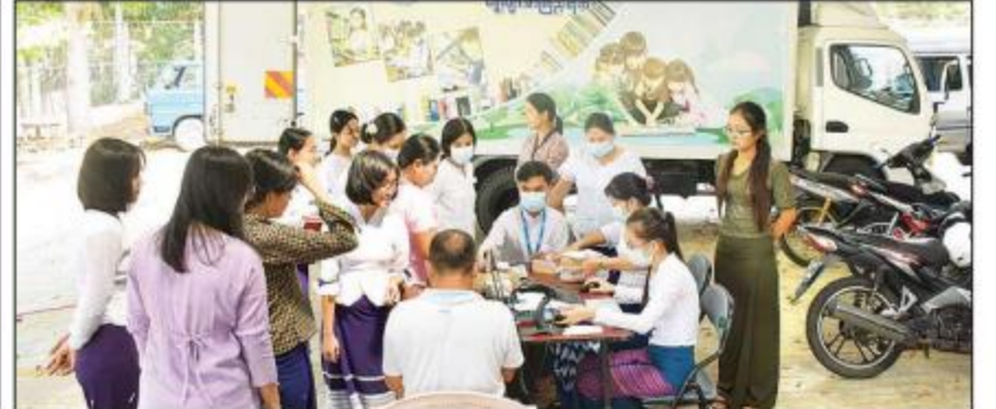
စိုက်ပျိုးရေး၊ မွေးမြူရေးနှင့် ဆည်မြောင်းဝန်ကြီးဌာနသို့ ရွှေ့လျားစာကြည့်တိုက်မော်တော်ယာဉ်ဖြင့် စာအုပ်၊ စာစောင်များ သွားရောက်ငှားရမ်းစဉ်။

မော်တော်ယာဉ်ဖြင့် ရုံးဌာနအရောက် လာရောက်ငှားရမ်းပေးတဲ့အတွက် ဝန်ထမ်းတွေအနေနဲ့ အချိန်ကုန်သက်သာပြီး အလုပ်အကိုင်မပျက်ဘဲ စာအုပ်စာပေတွေကို ဖတ်ရှုလေ့လာနိုင်ပါတယ်။ ဒီရွှေ့လျားစာကြည့်တိုက်မော်တော်ယာဉ်မှာလည်း ယခင်က နာမည်ကြီးခဲ့တဲ့ စာရေးဆရာကြီးတွေရဲ့ စာအုပ်တွေပါရှိသလို ယနေ့ခေတ် နာမည်ရ စာရေးဆရာတွေရဲ့ စာအုပ်များကိုလည်း စုံလင်စွာပါရှိတဲ့အတွက် တစ်နေရာတည်းကနေ စာပေကဏ္ဍကို ဖတ်ရှုလေ့လာခွင့်ရရှိလို့ အင်မတန်ကျေနပ်ဝမ်းသာမိပါတယ်။ ကျေးဇူးလည်းတင်ပါတယ်" ဟု စိုက်ပျိုးရေး၊ မွေးမြူရေးနှင့် ဆည်မြောင်းဝန်ကြီးဌာနမှ စာအုပ်ငှားသူတစ်ဦးက ပြောသည်။