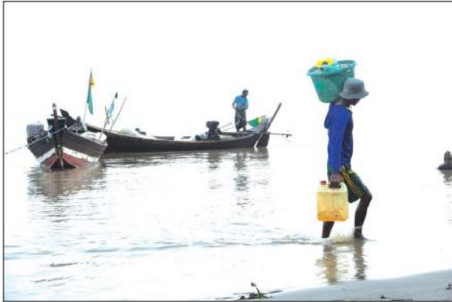
ကမ်းနီးရေတိမ် ငါးဖမ်းဆီးရေးလုပ်ငန်း လုပ်ကိုင်နေစဉ်

ရန်ကုန် မတ် ၃၁ ရန်ကုန်တိုင်းဒေသကြီးအတွင်း ပင်လယ်ပြင်နှင့် ထိစပ်နေသော ရေလုပ်ငန်းလုပ်ကိုင်သည့်ကျေးရွာများ ကမ်းနီး ရေတိမ်ပင်လယ်ပြင်ငါး၊ ပုစွန် ဖမ်းဆီးရာ၌ ယခုမတ်လဆန်းပိုင်းမှစ၍ ဖမ်းဆီးရရှိမှု အထိ အမိ နည်းလာကြောင်း သိရသည်။