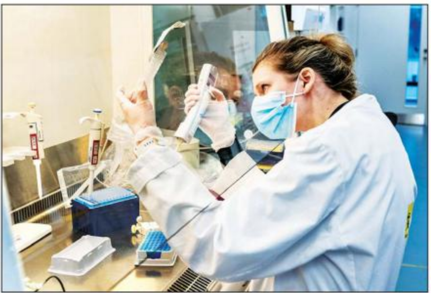
ဒိန်းမတ်နိုင်ငံတွင် ကိုရိုနာဗိုင်းရပ်စ်မှုကွဲများ ပျံ့နှံ့လျက်ရှိသည်ကို သုတေသနပြုလေ့လာနေသည်ကို တွေ့ရစဉ်။

ထို့အပြင် ကမ္ဘာ့ကျန်းမာရေးအဖွဲ့က နောက်ထပ် စိတ်ဝင်စားဖွယ်ကောင်းသော ကိုရိုနာဗိုင်းရပ်စ် မျိုးကွဲခြောက်မျိုးနှင့် ပတ်သက်ပြီး သတိပေးထားသည်။ အဆိုပါမျိုးကွဲများတွင် ဖိလစ်ပိုင်နှင့် ဂျပန်နိုင်ငံတွင် ဖေဖော်ဝါရီလက တွေ့ရှိခဲ့သော မျိုးရိုးဗီဇများနှင့် ပြင်သစ်နိုင်ငံတွင် ဇန်နဝါရီလက တွေ့ခဲ့သော မျိုးရိုးဗီဇ များ ပါဝင်သည်။ ကမ္ဘာတစ်ဝန်းလုံးအတိုင်းအတာဖြင့် ကိုဗစ်-၁၉ ကူးစက်ဖြစ်ပွားမှုများ ဆက်လက် မြင့်တက်လျက်ရှိပြီး ဘရာဇီး၊ အမေရိကန် ပြည်ထောင်စု၊ အိန္ဒိယနှင့် ပိုလန်နိုင်ငံတို့တွင် ကူးစက်ဖြစ်ပွားမှု အများဆုံးဖြစ်သည်။