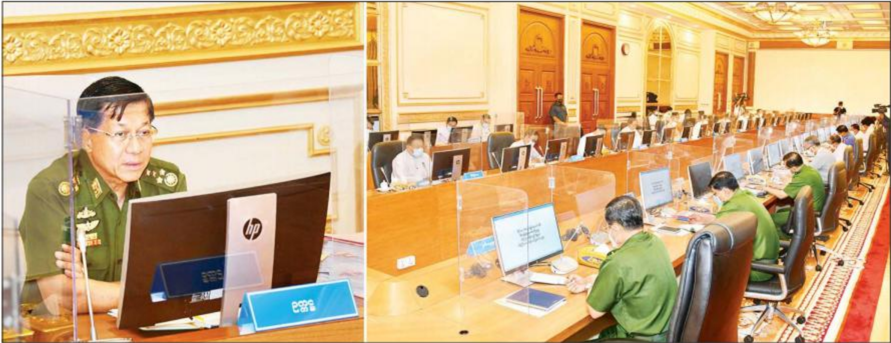
နိုင်ငံတော်စီမံအုပ်ချုပ်ရေးကောင်စီဥက္ကဋ္ဌ၊ တပ်မတော်ကာကွယ်ရေးဦးစီးချုပ် ဗိုလ်ချုပ်မှူးကြီး မင်းအောင်လှိုင် နိုင်ငံတော်စီမံအုပ်ချုပ်ရေးကောင်စီ စီမံခန့်ခွဲရေးကော်မတီအစည်းအဝေး (၄/၂၀၂၁)တွင် သတင်းစဉ် အမှာစကားပြောကြားစဉ်။

နိုင်ငံရေးအတွက် အမျိုးသားစည်းလုံးညီညွတ်ရေးနှင့် ငြိမ်းချမ်းရေး ဖော်ဆောင်မှုပဟိုကော်မတီ၊ အမျိုးသားစည်းလုံးညီညွတ်ရေးနှင့် ငြိမ်းချမ်းရေးဖော်ဆောင်မှုလုပ်ငန်းကော်မတီနှင့် အမျိုးသားစည်းလုံး ညီညွတ်ရေးနှင့် ငြိမ်းချမ်းရေးဖော်ဆောင်မှု ညှိနှိုင်းရေးကော်မတီ တို့ကိုလည်း ဖွဲ့စည်းထားရှိပြီး ဖြစ်ပါသည်။ ၃။ အဆိုပါ တပ်မတော်၏ ငြိမ်းချမ်းရေးဆွေးနွေးမှုကော်မတီနှင့် တစ်နိုင်လုံး ပစ်ခတ်တိုက်ခိုက်မှုရပ်စဲရေး သဘောတူစာချုပ် (NCA) လမ်းကြောင်းအတိုင်း (NCA) လက်မှတ်ရေးထိုးပြီးသည့် တိုင်းရင်းသား လက်နက်ကိုင်အဖွဲ့အစည်းများနှင့် ငြိမ်းချမ်းရေးပိုမိုခိုင်မာအောင် စာမျက်နှာ ၅ ကော်လံ ၁ *