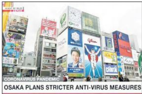
ဂျပန်နိုင်ငံ အိုဆာကာမြို့ရှိ နေရာတစ်ခုကိုတွေ့ရစဉ်။