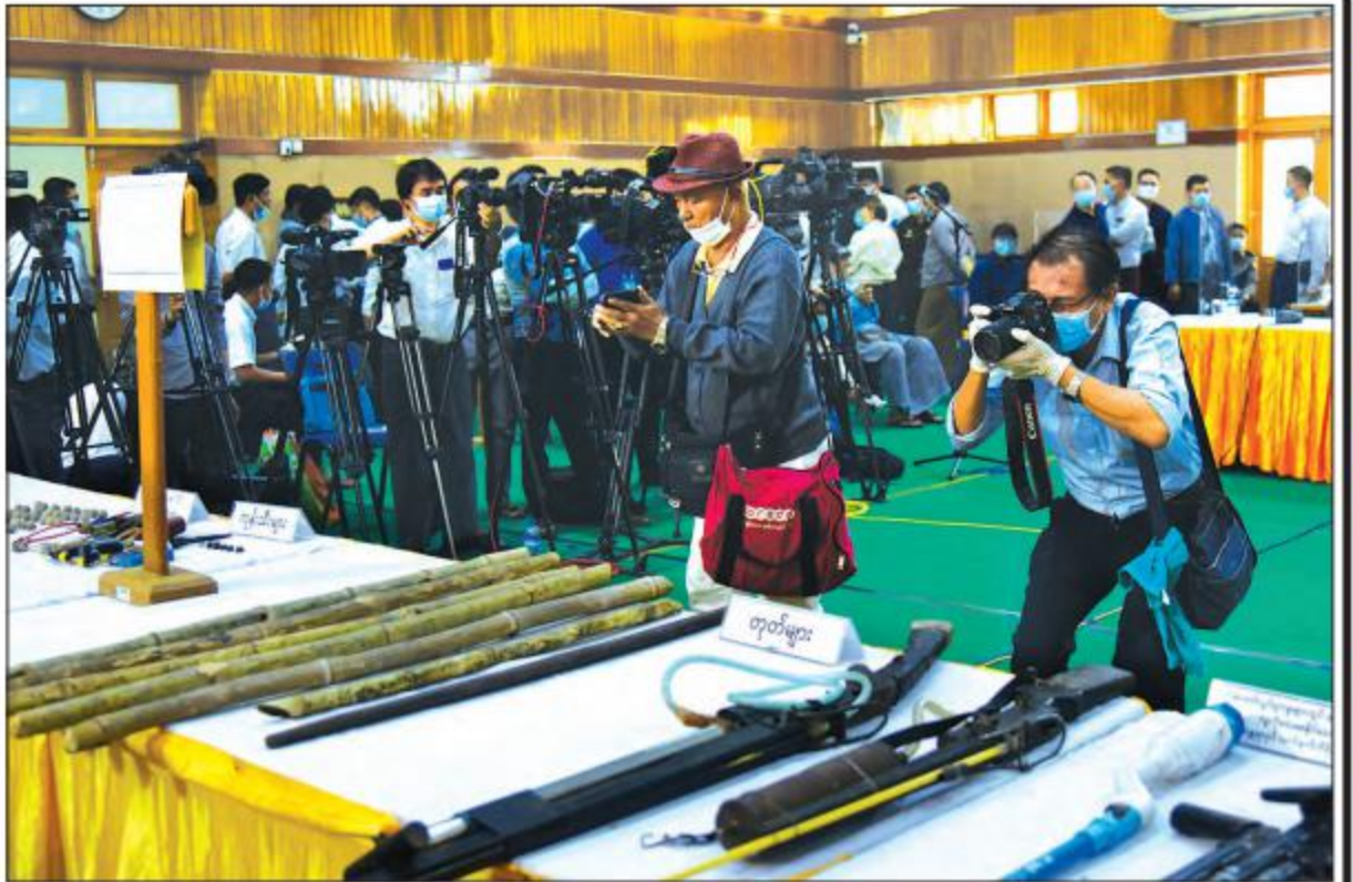
သတင်းစာရှင်းလင်းပွဲသို့ တက်ရောက်လာကြသူများက သိမ်းဆည်းရမိသည့် ဆူပူအကြမ်းဖက်လှုပ်ရှားမှုများတွင် အသုံးပြုလာသော ဒေသန္တရလုပ်လက်နက်၊ ကိရိယာပစ္စည်းများ ခင်းကျင်းပြသထားမှုကို ကြည့်ရှုလေ့လာကြစဉ်။

ဗိုလ်မှူးချုပ် ဇော်မင်းထွန်းက အခြေခံပညာကျောင်းများနှင့်ပတ်သက်ပြီး အကြမ်းဖျင်းအနေဖြင့် နံပါတ်တစ် အခြေခံပညာကျောင်းများကို စတင်ဖွင့်မည်ဖြစ်ကြောင်း၊ တက္ကသိုလ်ကောလိပ်အဆင့်တွင် ပါရဂူတန်း၊ မာစတာတန်းများဖွင့်မည်ဖြစ်ပြီး ကျန်အတန်းများ လောလောဆယ်အစီအစဉ်မရှိသေးပါကြောင်း၊ အခြေခံပညာကျောင်းများကို ဖွင့်သည့်အခါ မိမိတို့အနေနှင့် လျာထားချက်က နောက်ကျနေသည့်အတွက် တစ်နှစ်ကို နှစ်တန်းဖွင့်မည်ဖြစ်ကြောင်း၊ တစ်နှစ်ကို နှစ်တန်း တက်ရမည်ဖြစ်ပြီး Grade-1 ကလေးသည် ပညာသင်နှစ်တစ်နှစ်တည်းတွင် Grade-1 လည်း ပြီးသွားရမည်၊ Grade-2 လည်း သင်ပြီး