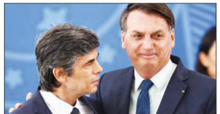
နုတ်ထွက်သွားသော ဘရာဇီးကျန်းမာရေးဝန်ကြီး နယ်လ်ဆန် တဲရစ် (ဝဲ)နှင့် သမ္မတ ဂျာဘောဆီနာရီ (ယာ) တို့ကိုတွေ့ရစဉ်။

ဘရာဇီး ကျန်းမာရေးဝန်ကြီးသည်လည်း ယခုလ အစောပိုင်းက ရာထူးမှ နုတ်ထွက်သွား ကြောင်း သိရသည်။ အင်န်အိတ်ချ်က