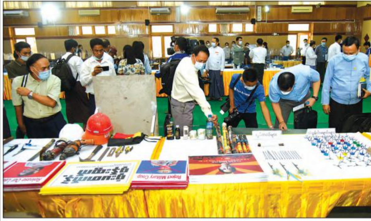
သတင်းစာရှင်းလင်းပွဲသို့ တက်ရောက်လာကြသူများက သိမ်းဆည်းရမိသည့် ဆူပူအကြမ်းဖက်လှုပ်ရှားမှုများတွင် အသုံးပြုလာသော ဒေသန္တရလုပ်လက်နက်၊ ကိရိယာပစ္စည်းများ ခင်းကျင်းပြသထားမှုကို ကြည့်ရှုလေ့လာကြစဉ်။

ပါကြောင်း၊ ညဘက်တွင် သတိပေးနေသည့် နယ်မြေလုံခြုံရေးအတွက်၊ တရားဥပဒေစိုးမိုးရေးအတွက် လူညံကင်း များလှည့်နေသည့်အခါ ကောလာဟလများနှင့် ပတ်သက်ပြီး နယ်မြေအလိုက် ၎င်းတို့ကိုပြန်ပြီး ဖြေရှင်းနိုင် အောင်၊ ပြန်ပြီး ပြည်သူလူထုများကို တိုက်ရိုက်ရောက်နိုင်အောင်လည်း မိမိတို့ ဆက်လက်ဆောင်ရွက် သွားမည်ဖြစ်ကြောင်း၊ ယခုလိုအကြံပေးခြင်းကိုလည်း လေးစားပါကြောင်း ရှင်းလင်းဖြေကြားသည်။ Myanmar National Post သတင်းဌာနမှ အယ်ဒီတာချုပ် နောင်တော်လေး က facebook team က ယခုချိန်ထိအလုပ်လုပ်နေဆဲ ဟုတ်/ မဟုတ် သိလိုကြောင်း၊ ယခုအချိန်တွင် ဆူပူမှုများ အသားပေးဖော်ပြ နေသည့် media များကို facebook က support လုပ်နေသည်ဟု ယူဆရပါကြောင်း၊ မိမိတို့ page များ ဖျက်ချခံရပါကြောင်း၊ အလားတူ နိုင်ငံတော်ပိုင် page များကိုလည်း ဖျက်ချခံရတာကို တွေ့ရပါကြောင်း၊ facebook team သက်တမ်းကုန်မည့်အချိန်ကို သိလိုကြောင်း၊ facebook team ရွေးချယ်သည့်အခါ အကုတ်လိုက်စားမှုများ ရှိခဲ့၊ မရှိခဲ့ကို သိလိုပါကြောင်း မေးမြန်းသည်။ ဗိုလ်မှူးချုပ် ဇော်မင်းထွန်းက facebook နှင့်ပတ်သက်ပြီး ရှေ့ဆက်လုပ်ဆောင်မည့် လုပ်ငန်းစဉ်များ ကိုသာ ပြန်လည်ဖြေကြားသွားမည်ဖြစ်ကြောင်း၊ facebook နှင့် ပတ်သက်၍ အခြားနိုင်ငံများ၌လည်း စည်းမျဉ်းစည်းကမ်းများရှိပါကြောင်း၊ facebook နှင့်ပတ်သက်၍ ပို့ဆောင်ဆက်သွယ်ရေးဝန်ကြီးဌာန၊ တရားဥပဒေနှင့်သက်ဆိုင်သည့် ဌာနများ၊ ငွေရေးကြေးရေးနှင့် သက်ဆိုင်သည့် ဌာနများက အသေးစိတ် လေ့လာလျက်ရှိကြောင်း၊ ဥပမာပြောရလျှင် Australia မှာဆိုလျှင် facebook နှင့်ပတ်သက်၍ တရားဥပဒေ အရ ဖြေရှင်းခဲ့ခြင်းရှိကြောင်း၊ အဆိုပါကိစ္စများနှင့်ပတ်သက်၍ မိမိတို့ လုပ်ဆောင်လျက်ရှိသည်ဟု ပြောလို ကြောင်း ပြန်လည်ဖြေကြားခဲ့သည်။ Myanmar National Post သတင်းဌာနမှ အယ်ဒီတာချုပ် နောင်တော်လေး က အမျိုးသားရေးတော့