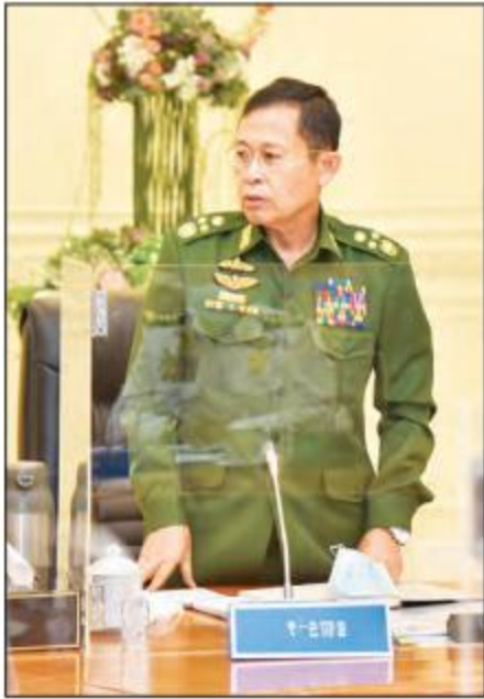
နိုင်ငံတော်စီမံအုပ်ချုပ်ရေးကောင်စီ ဒုတိယဥက္ကဋ္ဌ ဒုတိယတပ်မတော် ကာကွယ်ရေးဦးစီးချုပ်၊ ကာကွယ်ရေးဦးစီးချုပ်(ကြည်း) ဒုတိယဗိုလ်ချုပ်မှူးကြီး စိုးဝင်း ရှင်းလင်းတင်ပြစဉ်။

တိုင်းဒေသကြီးနှင့် ပြည်နယ်အားလုံးတွင် ဒေသနှင့်ကိုက်ညီသော စီးပွားရေးလုပ်ငန်းများ ဖော်ဆောင်ရန်နှင့် ဒေသအားလုံး တစ်ပြေးညီ ဖွံ့ဖြိုးတိုးတက်အောင် ဆောင်ရွက်၍ ကျေးလက်နှင့် ဖွံ့ဖြိုးဆင်းရဲချမ်းသာကွာဟမှု လျှော့ချရန်လိုအပ်ကြောင်း၊ နိုင်ငံတစ်နံပါတ်လျားရှိ စီးပွားရေးလုပ်ငန်းများ ဖွံ့ဖြိုးတိုးတက်အောင် ရှိပြီးသား အခြေခံကောင်းများကို အသုံးပြု၍ စဉ်းစားဆောင်ရွက်သွားရန် လိုကြောင်း၊ ပုသိမ်၊ မော်လမြိုင်နှင့် ထားဝယ်တို့တွင် ပင်လယ်ကူး