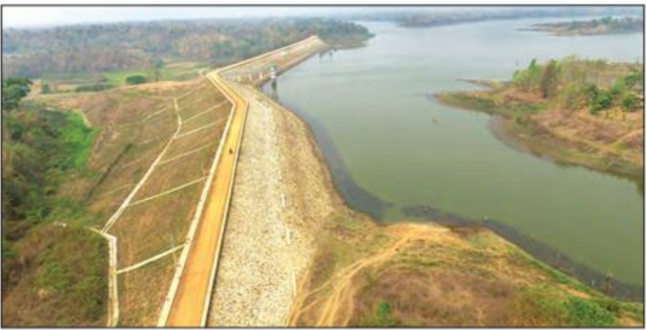
ချောင်းမငယ်ရေလျှောင်တံခံ

၂၀၀၆ - ၂၀၀၇ ခုနှစ်တွင် တည်ဆောက်ပြီးစီးခဲ့သည့် အဆိုပါရေလျှောင်တံခံတွင် တူးမြောင်းမကြီးအလျား ၁၉ မိုင်၊ လက်တံမြောင်းများအလျား ၂၉မိုင်၊ တူးမြောင်းအဆောက်အအုံ ၃၉၆ ခု ရှိပြီး ဆည်ရေပေးဝေနိုင်သည့် စီစစ်ပြီး ဖို့ရိယာမှာ ၇၂၁၉ ဧကရှိသည်။ ထို့အပြင် ရေအားလျှပ်စစ်တပ်ဆင်အား