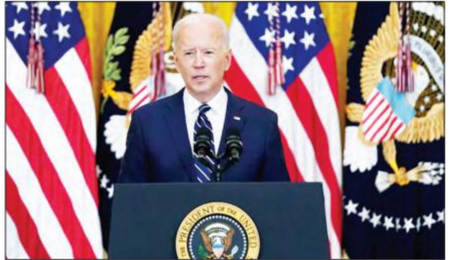
အမေရိကန်သမ္မတ ဂျိုးဘိုင်ဒင်

ယခုလအစောပိုင်းတွင် ဘိုင်ဒင်က ပြည်နယ်များ၊ မျိုးနွယ်စုများအချုပ်အခြာပိုင်နက် နယ်မြေများ အားလုံးရှိ အရွယ်ရောက်ပြီးသူ အမေရိကန်ပြည်သူ များ အားလုံးကို မေ ၁ ရက်တွင် ကိုဗစ်- ၁၉ ကာကွယ်ဆေးထိုးနှံပေးသွားမည်ဖြစ်ကြောင်း ပြော ကြားခဲ့သည်။