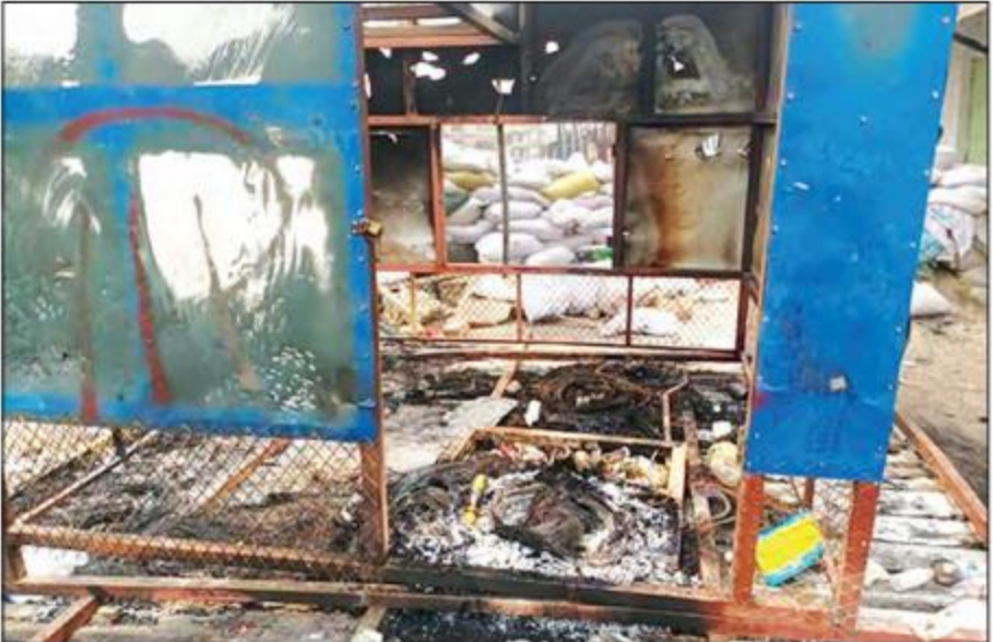
မူဆယ်မြို့၊ ဟိုမုန်ရပ်ကွက် ကံကော်မီးပွိုင့်ရှိ အချက်ပြမီး ထိန်းချုပ်ခန်းအဆောက်အအုံ မီးရှို့ဖျက်ဆီးခံရမှု။

နေပြည်တော် မတ် ၃၀ ဆူပူအကြမ်းဖက်သူ လူစုလူဝေးများအနေဖြင့် အကြမ်းဖက်လုပ်ရပ်များ တစ်နေ့ထက်တစ်နေ့ ပိုမို လုပ်ဆောင်လာနေကြရာ ယနေ့တွင် တိုင်းဒေသကြီး/ပြည်နယ်များ၌ မြို့နယ်အချို့ရှိ နိုင်ငံတော်ပိုင်အဆောက်အအုံများ၊ ယာဉ်/ယန္တရားများကို မီးပုလင်းဖြင့် ပစ်ခတ်ခြင်း၊ မီးရှို့ဖျက်ဆီးခြင်းများ ဆောင်ရွက်ခဲ့ကြသည်ကို တွေ့ရှိရသည်။ ထိုသို့ ဖျက်ဆီးမှုလုပ်ရပ်များ လုပ်ဆောင်ခဲ့ရာတွင် နံနက် ၂ နာရီ မိနစ် ၂၀ တွင် စမ်းချောင်းမြို့နယ်၊ စမ်းချောင်းမြောက်ပွဲကော်မရှင်ရုံးအား ဓာတ်ဆီပုလင်းဖြင့် ပစ်ခတ်မီးရှို့မှု၊