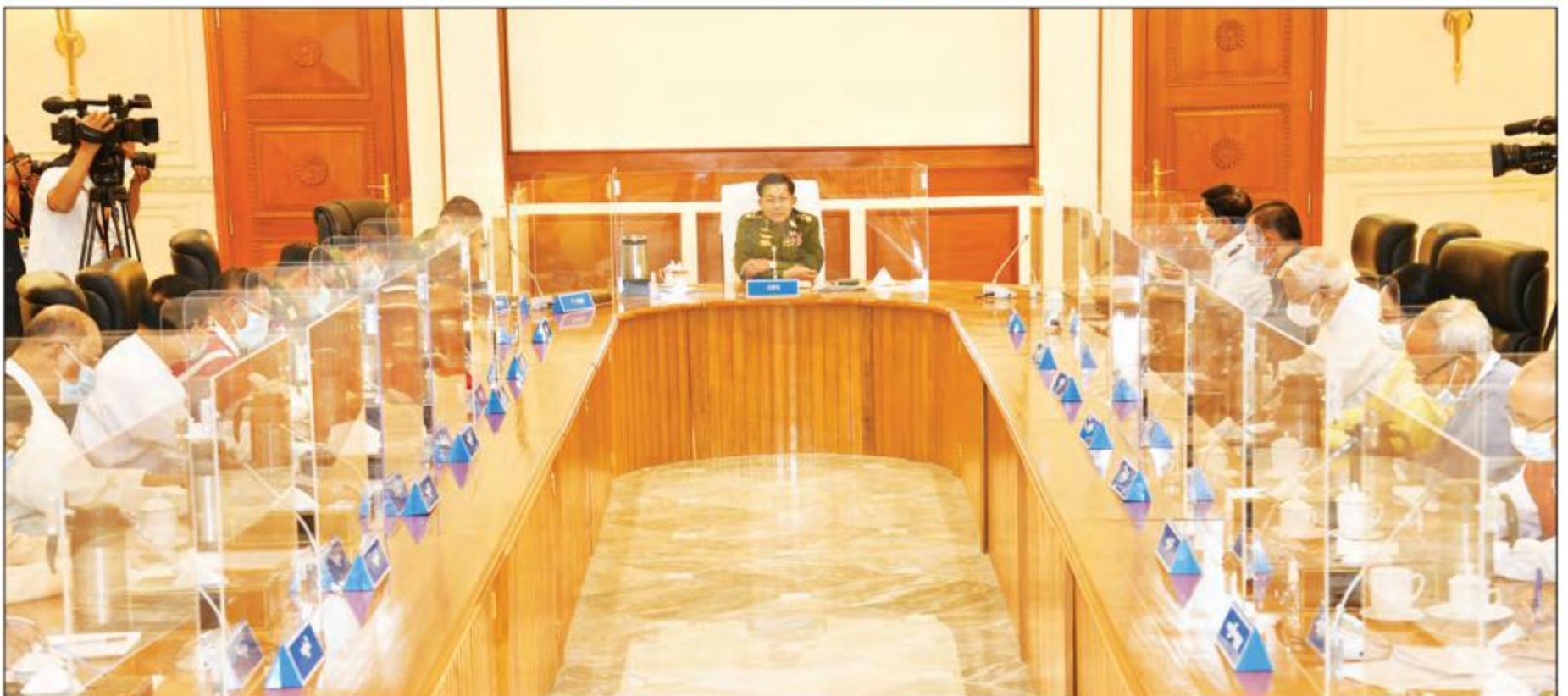
နိုင်ငံတော်စီမံအုပ်ချုပ်ရေးကောင်စီဥက္ကဋ္ဌ၊ တပ်မတော်ကာကွယ်ရေးဦးစီးချုပ် ဗိုလ်ချုပ်မှူးကြီး မင်းအောင်လှိုင် နိုင်ငံတော်စီမံအုပ်ချုပ်ရေးကောင်စီအစည်းအဝေး (၈/၂၀၂၁)တွင် အမှာစကားပြောကြားစဉ်။

စစ်မှန်သည့် ပါတီစုံဒီမိုကရေစီလမ်းကြောင်းဖြစ်ပေါ်စေရေး တပ်မတော်အနေဖြင့် နိုင်ငံခြားမာမာဆုံးဖြတ်ချက်ချထား နိုင်ငံတိုးတက်ကောင်းမွန်စေရေးအတွက် ဆောင်ရွက်နေခြင်းဖြစ်သဖြင့် အောင်မြင်မည်ဟု ယုံကြည်