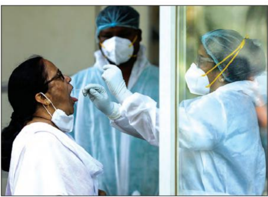
အိန္ဒိယနိုင်ငံတွင် ကိုဗစ်-၁၉ ဆေးစစ်မှု ပြုလုပ်ပေးနေစဉ်။

နယူးဒေလီ မတ် ၃၀ အိန္ဒိယနိုင်ငံတွင် မတ် ၃၀ ရက်က ကိုဗစ်-၁၉ ကူးစက်ခံရသူ ၅၆၂၁၁ ဦး ထပ်မံတွေ့ရှိခဲ့ရာ စုစုပေါင်းကူးစက်ခံရသူ စုစုပေါင်း ၁၂၀၉၅၈၅၅ ဦး ရှိလာသည်ဟု ကျန်းမာရေးဝန်ကြီးဌာနက ပြောသည်။ နောက်ထပ် ၂၇၁ ဦး ကိုဗစ်-၁၉ နှင့် ဆက်စပ်သည့်ရောဂါများကြောင့် သေဆုံးခဲ့သည့်အတွက် သေဆုံးသူစုစုပေါင်းမှာ ၁၆၂၁၁၄ ဦးအထိ ရှိလာသည်။ တိုင်းပြည်အတွင်း လက်ရှိ ရောဂါဖြစ်ပွားနေသူ ၅၄၀၇၂၀ ရှိပြီး ဆေးရုံမှဆင်းသွားသူ အရေအတွက်မှာ ၁၁၃၉၃၀၂၁ ဦးရှိသည်။ ပြီးခဲ့သည့်ရက်ပိုင်းအတွင်းမှ စတင်ကာ အိန္ဒိယနိုင်ငံအတွင်း နေ့စဉ် ကိုဗစ်-၁၉ ကူးစက်မှုမှာ ပြန်လည်များပြားလာခဲ့သည်။ ဇန်နဝါရီလအတွင်းက တိုင်းပြည်အတွင်း ကိုဗစ်-၁၉ နေ့စဉ် ကူးစက်မှုနှုန်းမှာ ၁၀၀၀၀ အောက်သို့ ကျဆင်းခဲ့သည်။ အိန္ဒိယနိုင်ငံသည် ဇန်နဝါရီလအတွင်းမှ စတင်ကာ တိုင်းပြည်အတွင်း ကိုဗစ်-၁၉ ကာကွယ်ဆေးထိုးနှံမှုကို စတင်ခဲ့ရာ ယခုအချိန်အထိ ၆၁ သန်းကျော်ကို ကာကွယ်ဆေးထိုးပေးပြီးဖြစ်သည်။ ဒေလီမြို့တွင် ကူးစက်မှု အများဆုံးဖြစ်သည်။ ဒေလီမြို့တွင် ကိုဗစ်-၁၉ ကြောင့် သေဆုံးသူ ၁၁၀၁၂ ဦး ရှိသည်ဟု ဒေလီမြို့ ကျန်းမာရေးဌာနက ပြောသည်။ ဆင်ဟွာ