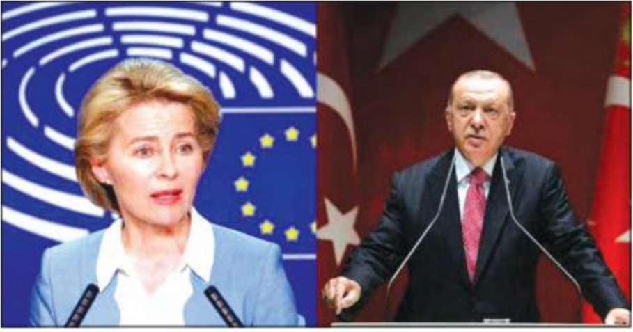
ဥရောပကော်မရှင်ဥက္ကဋ္ဌ အာဆူလာဗွန်ဒါလီယန်နှင့် တူရကီသမ္မတ ရီဆက်တေရစ်အာဒိုဂန်။