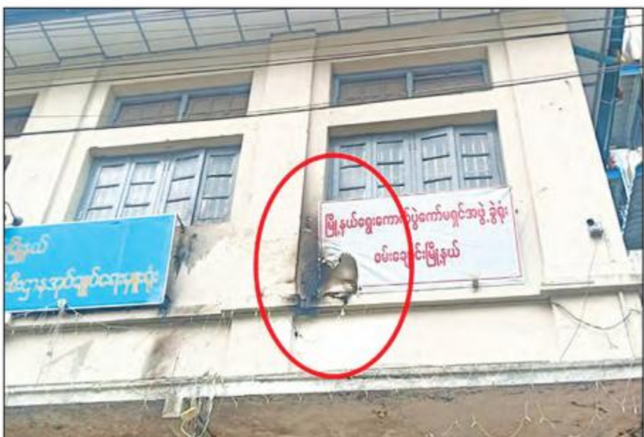
စမ်းချောင်းမြို့နယ် ရွေးကောက်ပွဲကော်မရှင်ရုံးအား ဓာတ်ဆီပုလင်းဖြင့် ပစ်ခတ်မီးရှို့မှု။

ဖက်သူ လူစုလူဝေးအင်အား ၃၀ ခန့်မှ မှန်များရှိကွဲ၍ မီးရှို့နေကြောင်း သတင်းအရ လုံခြုံရေးတပ်ဖွဲ့ဝင်များပါဝင်သော ပူးပေါင်းအဖွဲ့သည် အခြေအနေအား ထိန်းသိမ်းနိုင်ရေး သွားရောက်ခဲ့ရာ ဆူပူအကြမ်းဖက်သူများမှ တုတ်၊ အုတ်ခဲ၊ ဂျင်ကလိများဖြင့် အကြမ်းဖက် ပစ်ခတ်ရန်ပြုခဲ့သဖြင့် လုံခြုံရေးတပ်ဖွဲ့ဝင်များက အဓိကရုဏ်း နှိမ်နင်းရေး လက်နက်များဖြင့် ခြောက်လှန့် ပစ်ခတ်လူစုခွဲခဲ့ရာ နံနက် ၁၁ နာရီတွင် လူစုကွဲသွားခဲ့ပြီး အကြမ်းဖက်သူများ မီးရှို့ဖျက်ဆီးမှုကြောင့် မီးပွိုင့်အချက်ပြမီး ထိန်းချုပ်ခန်း အဆောက်အအုံ၏ မှန် ၂ ချပ်ကွဲပြီး အဆောက်အအုံအတွင်း မီးလောင်ပျက်စီး ဆုံးရှုံးခဲ့သည်။ အလားတူ နံနက် ၁၀ နာရီ ၄၅ မိနစ်တွင် စဉ့်ကိုင်မြို့နယ်၊ ရဲစုကျေးရွာအနီးတွင် မြေတူးစက်တစ်စီး မီးရှို့ဖျက်ဆီးခံထားရကြောင်း သတင်းအရ လုံခြုံရေးတပ်ဖွဲ့ဝင်များ ပါဝင်သောပူးပေါင်းအဖွဲ့မှ သွားရောက်စစ်ဆေးခဲ့ရာ ရဲစု ကျေးရွာအနီးတွင် ရေနုတ်မြောင်း တူးဖော်နေသည့် စဉ့်ကိုင်မြို့နယ် စည်ပင်သာယာရေး ဌာနပိုင် မြေတူးစက်ငယ် တစ်စီးဖြစ်ကြောင်းတွေ့ရှိရပြီး အကြမ်းဖက်သူလူစုမှ မီးရှို့ဖျက်ဆီးခြင်းဖြစ်ပြီး မီးလောင်ကျွမ်းမှုကြောင့် ယာဉ်၏ အစိတ်အပိုင်းအများစု မီးလောင်ခဲ့ပြီး ခန့်မှန်းတန်ဖိုး ကျပ်သိန်း ၂၅၀ ခန့် ပျက်စီးဆုံးရှုံးခဲ့သည်။ အထက်ပါဖြစ်စဉ်များအတွင်း အကြမ်းဖက်မှုလုပ်ရပ် ကျူးလွန်ခဲ့သူများအား ဥပဒေနှင့်အညီ ထိရောက်စွာ အရေးယူနိုင်ရေး စုံစမ်းစစ်ဆေး ဖော်ထုတ်လျက်ရှိကြောင်း သတင်းရရှိသည်။ သတင်းစဉ်