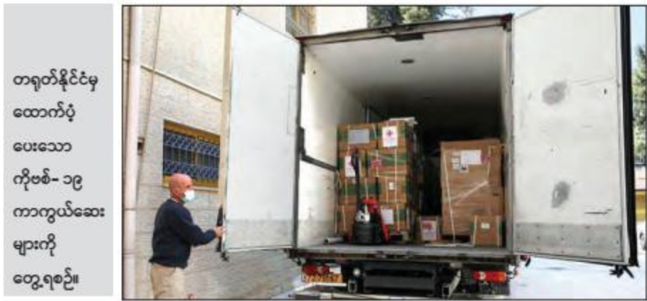
တရုတ်နိုင်ငံမှ ထောက်ပံ့ ပေးသော ကိုဗစ်- ၁၉ ကာကွယ်ဆေး များကို တွေ့ရစဉ်။