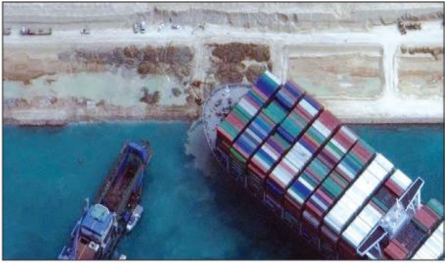
စူးအက်တူးမြောင်းအတွင်း ကန့်လန့်ခံနေသည့်သင်္ဘောကို တွေ့ရစဉ်။

ကိုင်ရို မတ် ၃၀ စူးအက်တူးမြောင်းအတွင်း ပိတ်ဆို့နေသည့် ကွန်တိန်နာသင်္ဘောကြီးကို အောင်မြင်စွာ ဖယ်ရှားနိုင်ပြီးနောက် တူးမြောင်းအတွင်း သင်္ဘောသွားလာမှု ပုံမှန်အတိုင်းပြန်လည်စတင်နိုင်ပြီဟု သိရသည်။ မတ် ၂၉ ရက် နံနက်ပိုင်းမှ စတင်ကာ တူးမြောင်းအတွင်း ရေလမ်းကိုပြန်လည်ဖွင့်လှစ်နိုင်ခဲ့သည်ဟု စူးအက်တူးမြောင်းအာဏာပိုင်အဖွဲ့ ဥက္ကဋ္ဌ အိုစမာ ရာဘီက ပြောသည်။ အဆိုပါကွန်တိန်နာသင်္ဘောကြီးသည် စူးအက်တူးမြောင်းတွင် ပြီးခဲ့သည့်သီတင်းပတ် အင်္ဂါနေ့မှ စတင်ကာ ကန့်လန့်ခံပိတ်မိနေခဲ့ခြင်းဖြစ်သည်။ အဆိုပါ သင်္ဘောကို ဂျပန်နိုင်ငံအနောက်ပိုင်း အခြေစိုက် ရှိအီဆိဆန်ကုမ္ပဏီက ပိုင်ဆိုင်ပြီး ထိုင်ဝမ်ကုမ္ပဏီက စီမံခန့်ခွဲခြင်းဖြစ်သည်။ ရက်ပေါင်းများစွာ သောင်တူးစက်၊ ဆွဲသင်္ဘောတို့ဖြင့် သင်္ဘောကို ဆွဲပြီးနောက်မှ မူလအတိုင်း ပြန်လည် သွားလာနိုင်ခဲ့သည်။ တူးမြောင်းအတွင်း အဆိုပါ သင်္ဘောပိတ်ဆို့မှုကြောင့် နောက်ထပ် သင်္ဘောပေါင်း ၄၂၂ စင်းမှာလည်း ရှေ့ဆက်တိုးမရ ဖြစ်ခဲ့ရသည်။ အင်န်အိတ်ချ်ကေ