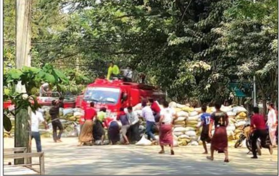
မီးသတ်ကားများအား အကြမ်းဖက်ဆူပူဆန္ဒပြသူများက ပိတ်ဆို့တားဆီးထားမှုကို တွေ့ရစဉ်။

ထိုဆူးကို အုပ်ဖြင့်ထွင်လျှင် နာသင့်သလောက် နာမည်ဖြစ်ကြောင်း၊ နာသင့်သလောက်နာခြင်းသည် မထွင်ဘဲနေပါက ဆူးစူးသည့်ခြေထောက် ဖြတ်ပစ်ရမည်စိုးသောကြောင့် ထွင်ရခြင်းဖြစ်ကြောင်း၊ ဆူးကြီး လျှင် ကြီးသလောက် နာမည်ဖြစ်ကြောင်း၊ ထို့ကြောင့် ခြေထောက်က ဦးနှောက်ကို မုန်းလိုက် မုန်းပါစေ၊ ပျောက်သွားလျှင် ဦးနှောက်နှင့် ခြေထောက် တစ်သားတည်းဖြစ်သွားမည်ဖြစ်ပြီး ကိစ္စမရှိပါကြောင်း ရှင်းလင်းဖြေကြားသည်။