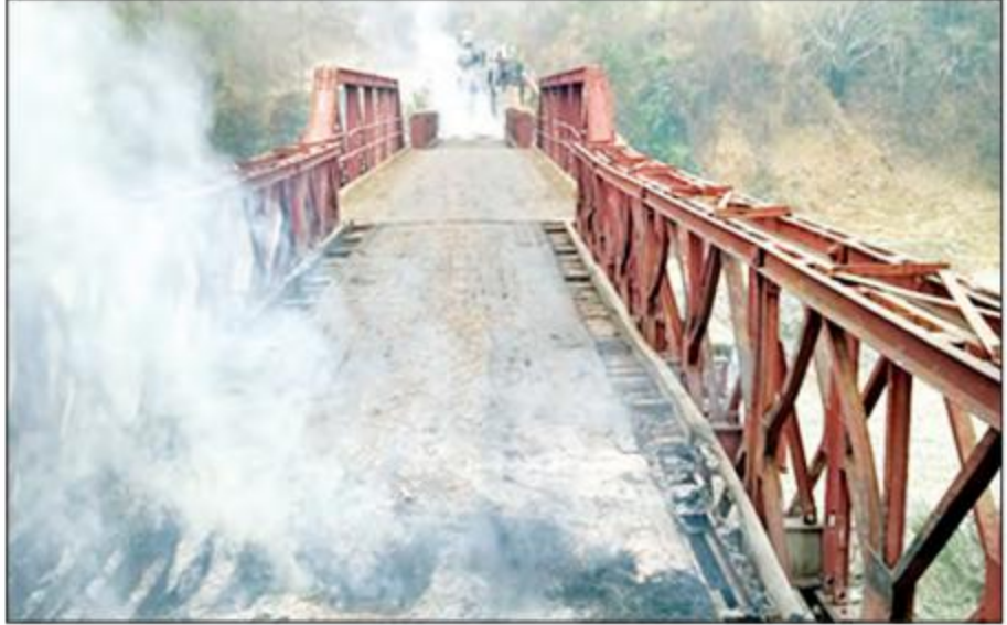
ကလေး-ဂင်္ဂါသွားကားလမ်းပေါ်ရှိ မြောင်းချောင်းတံတားအား ဆူပူအကြမ်းဖက်သူများက မီးရှို့ဖျက်ဆီးထားမှုကို တွေ့ရစဉ်။

မီးပုလင်းများဖြင့် ပစ်ခတ်ခဲ့သဖြင့် ရဲစခန်း အုတ်တံတိုင်းခုံရုံအနီး မီးလောင်ကျွမ်းခြင်း၊ လူပျို ဆောင် မီးအနည်းငယ်လောင်ကျွမ်းခြင်းတို့ ဖြစ်ပေါ်