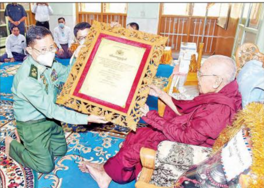
နိုင်ငံတော်စီမံအုပ်ချုပ်ရေးကောင်စီ ဒုတိယဥက္ကဋ္ဌ၊ ဒုတိယတပ်မတော် ကာကွယ်ရေးဦးစီးချုပ် ကာကွယ်ရေးဦးစီးချုပ် (ကြည်း) ဒုတိယဗိုလ်ချုပ်မှူးကြီး စိုးဝင်း မဟာနန္ဒိသေနာရာမတိုက် ဆရာတော် ဘဒ္ဒန္တတိလောကာဘိဝံသထံ အဘိဓမ္မဟာရဋ္ဌဂုရု ဘွဲ့တံဆိပ်တော် ဆက်ကပ်ပူဇော်

နေပြည်တော် မတ် ၂၉ မန္တလေးတိုင်းဒေသကြီး၊ ချမ်းမြသာစည်မြို့နယ်၊ ကျွန်းလုံးညွှန်ရွာကွက်၊ မဟာနန္ဒိသေနာရာမတိုက်ဆရာတော် ဘဒ္ဒန္တတိလောကာဘိဝံသ (ပါဠိပါရဂူ) အား ၂၀၂၁ ခုနှစ်၊ အဘိဓမ္မဟာရဋ္ဌဂုရု ဘွဲ့တံဆိပ်တော်ဆက်ကပ်ပူဇော်ပွဲ မဟာမင်္ဂလာ အခမ်းအနားကို ယနေ့နံနက်ပိုင်းတွင် အဆိုပါ ကျောင်းတိုက်၌ကျင်းပရာ နိုင်ငံတော်စီမံအုပ်ချုပ်ရေးကောင်စီ ဒုတိယဥက္ကဋ္ဌ၊ ဒုတိယတပ်မတော် ကာကွယ်ရေးဦးစီးချုပ် ကာကွယ်ရေးဦးစီးချုပ် (ကြည်း) ဒုတိယဗိုလ်ချုပ်မှူးကြီးစိုးဝင်း တက်ရောက်ကြည့်ရှု၍ ဘွဲ့တံဆိပ်တော် ဆက်ကပ်ပူဇော်သည်။