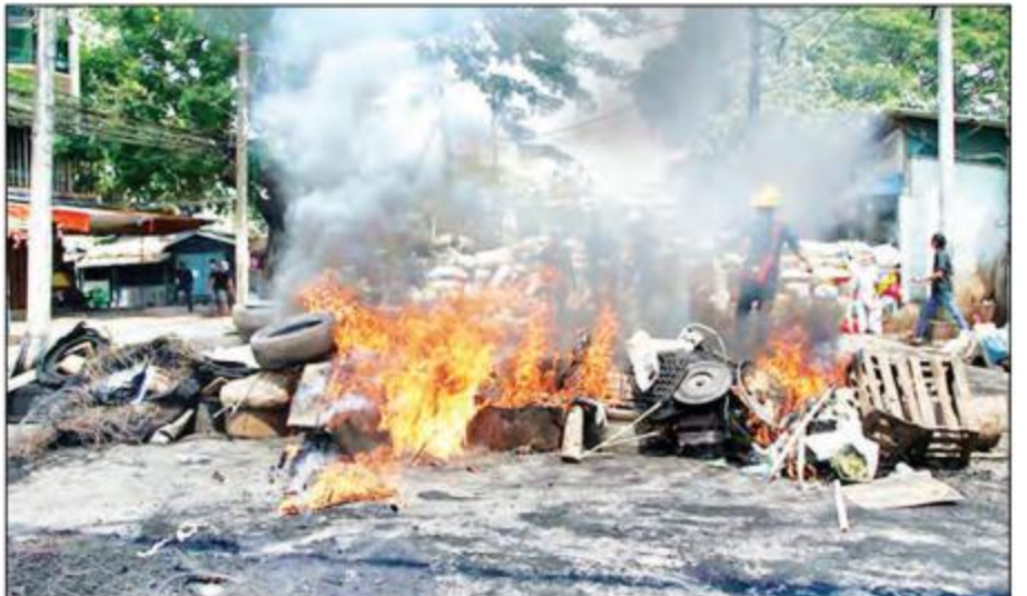
သာကောတမြို့နယ်၌ ဆူပူအကြမ်းဖက်သူများက လမ်းများပိတ်ဆို့၍ မီးရှို့ဖျက်ဆီးထားမှုကို တွေ့ရစဉ်။

ဖြစ်စဉ်မှာ မွန်လွဲ ၁၂ နာရီခွဲခန့်တွင် တောင်ဒဂုံ မြို့နယ် (၇၀)ရပ်ကွက် ကျန်စစ်သားလမ်းနှင့် ရတနာပုံလမ်းဆုံရှိ ကွန်ကရစ်တံတားအား ဦးဆောင်သူ (စီစစ်ဆဲ) ဆူပူအကြမ်းဖက်သူ လူစု လူဝေးအင်အား ၃၀ ခန့်က တံတားလမ်းပန်းပေါ်ရှိ ကွန်ကရစ်တံတားများအား ဖယ်ရှားဖျက်ဆီးကာ အများ ပြည်သူ ဖြတ်သန်းသွားလာမှုမရအောင် ပြုလုပ်နေ သည့်အတွက် လုံခြုံရေးတပ်ဖွဲ့ဝင်များပါဝင်သော ပူးပေါင်းအဖွဲ့က ၎င်းအကြမ်းဖက်သူလူအုပ်စုအား အကြမ်းဖက် ဖျက်ဆီးမှုလုပ်ရပ်အားရပ်တန့်၍ လူစုခွဲရန် ဥပဒေနှင့်အညီ သတိပေးတားမြစ်ခဲ့ သော်လည်း လူစုခွဲမှုမရှိဘဲ ဆက်လက်၍ ဖျက်ဆီး