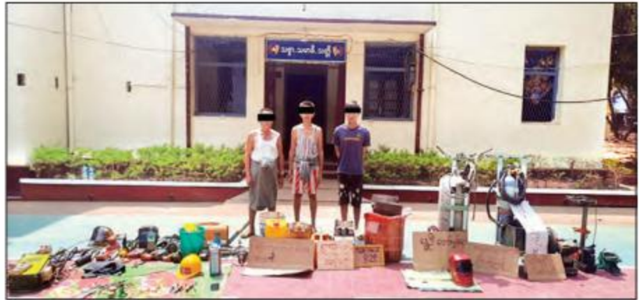
ကျိုက်ထိုမြို့နယ်၌ ဆူပူအကြမ်းဖက်ရာတွင်အသုံးပြုသည့် ပစ္စည်းများနှင့်အတူ ဖမ်းဆီးရမိသူများအား တွေ့ရစဉ်။

ဆူပူအကြမ်းဖက်ရာတွင် အသုံးပြုမည့် လက်နက်၊ ဆက်စပ်ပစ္စည်းများနှင့်အတူ ဖမ်းဆီးထိန်းသိမ်းရမိသူများကို ဥပဒေအရထိရောက်စွာ အရေးယူနိုင်ရန် အမှုဖွင့်လှစ် ဆောင်ရွက်လျက်ရှိကြောင်းနှင့် စစ်ဆေးရှာဖွေသတင်းဖော်ထုတ်မှုများကို ဆက်လက်ဆောင်ရွက်လျက်ရှိကြောင်း သတင်းရရှိသည်။ သတင်းစဉ်