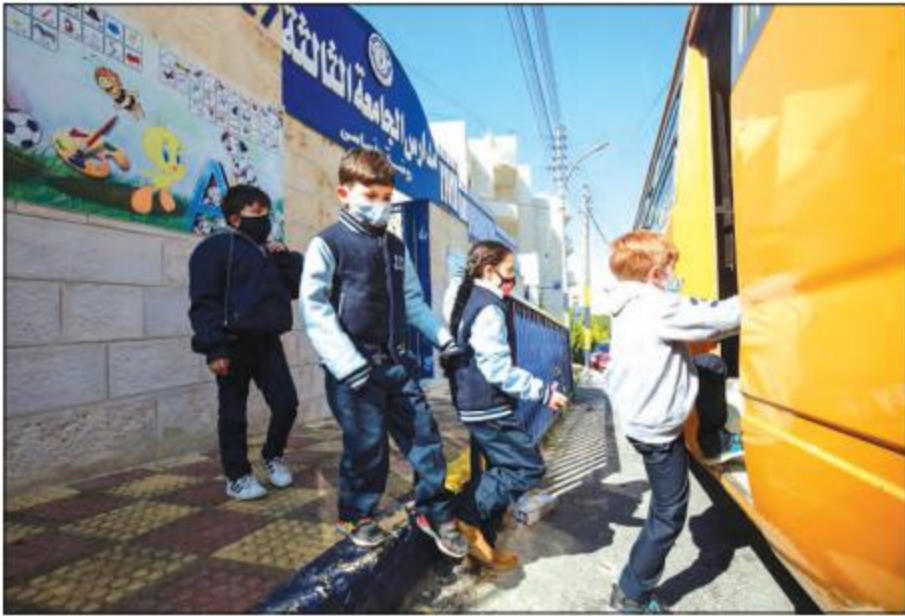
ဂျော်ဒန်နိုင်ငံမှ ကလေးငယ်များ ကျောင်းတက်ရန် ကျောင်းကားပေါ်တက်နေကြသည်ကို တွေ့ရစဉ်။

အမ္မန် မတ် ၂၉ ဂျော်ဒန်နိုင်ငံတွင် မေ ၁၅ ရက်အထိ တစ်စိတ်တစ်ပိုင်း သတ်မှတ်ချိန်အတွင်း အပြင်မထွက်ရအမိန့်ကို သက်တမ်းတိုးလိုက်ကြောင်း မတ် ၂၈ ရက်တွင် ဂျော်ဒန်အစိုးရက ကြေညာခဲ့သည်။ လက်ရှိထုတ်ပြန်ထားသည့် သတ်မှတ်ချိန်အတွင်း အပြင်မထွက်ရအမိန့်မှာ မတ်လကုန်တွင် သက်တမ်းကုန်ဆုံးမည်ဖြစ်သော်လည်း ကိုဗစ်-၁၉ ကူးစက်မှုများကို ကာကွယ်နိုင်ရေးအတွက် မေ ၁၅ ရက်အထိ သက်တမ်းတိုးသွားမည်ဟု အမ္မန်မြို့တွင် ပြုလုပ်သည့် သတင်းစာရှင်းလင်းပွဲတွင် ဂျော်ဒန်နိုင်ငံ၏ သတင်းမီဒီယာရေးရာဝန်ကြီး ဆာခါဒုဒင်က ကြေညာခဲ့သည်။ စီးပွားရေးလုပ်ငန်းများကို နှိမ်နင်း နှောင့်နှေးစေရန်မရှိအောင် ဖွင့်ခွင့်ပေးမည်ဖြစ်သည်။ ပြည်သူများသည် နံနက် ၇ နာရီမှ ညနေ ၆ နာရီ အတွင်းသာ အပြင်ထွက်သွားလာလှုပ်ရှားခွင့်ရမည် ဖြစ်သည်။ သောကြာနေ့တိုင်း အပြင်ထွက်ခွင့်ရမည် မဟုတ်ပေ။ မင်္ဂလာခန်းမများနှင့် အားကစားခန်းမများကိုလည်း ဆက်လက်ပိတ်ထားရဦးမည်ဖြစ်သည်။ ဂျော်ဒန်နိုင်ငံတွင် ကိုဗစ်-၁၉ ကြောင့် သေဆုံးမှုနှုန်း၊ ကူးစက်