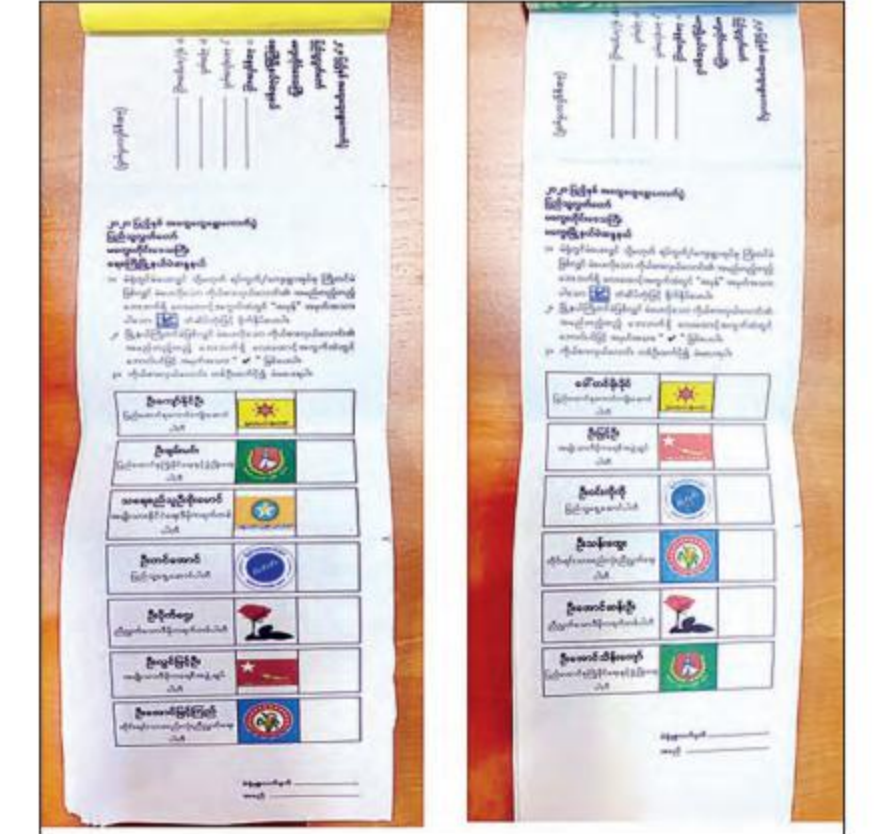
ရေစကြိုမြို့နယ် ပြည်သူ့လွှတ်တော်ကိုယ်စားလှယ်လောင်းများပါဝင်သော မဲလက်မှတ်စာအုပ်များနှင့် သက်ဆိုင်ခြင်းမရှိသော မကျေးမြို့နယ် ပြည်သူ့လွှတ်တော်ကိုယ်စားလှယ်လောင်းများ ပူးတွဲပါရှိနေသည့် ဆန္ဒမဲလက်မှတ်များ