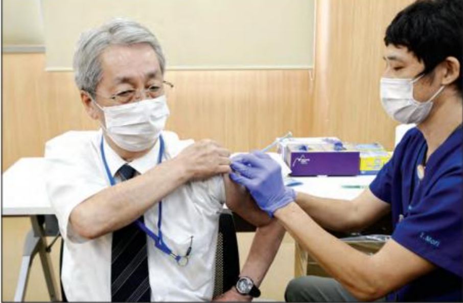
ဂျပန်နိုင်ငံတွင် ကိုဗစ်-၁၉ ကာကွယ်ဆေးထိုးပေးနေသည်ကို တွေ့ရစဉ်။

တိုကျို မတ် ၂၉ တိုကျိုမြို့တော် အနီးတစ်ဝိုက်တွင် နောက်ထပ်ဖြစ်လာနိုင်သည့် ကိုဗစ်-၁၉ ကူးစက်မှုများကို နှိမ်နင်းရန်အတွက် ကာကွယ်ဆေးထိုးနှံပေးနိုင်မှုမှာ အကန့်အသတ်အားဖြင့်သာ အကျိုးသက်ရောက်မှုရှိနိုင်မည်ဟု ဂျပန် သုတေသနအဖွဲ့တစ်ဖွဲ့က ပြောသည်။ တိုကျိုမြို့တွင် မည်သို့ ကူးစက်သည်ကို လေ့လာနေသည့် ဆုကုဘာတက္ကသိုလ်မှ သုတေသီများက မတ် ၂၁ ရက်တွင် အဆုံးသတ်သွားသည့် အရေးပေါ်အခြေအနေထုတ်ပြန်မှုပြီးနောက် ကူးစက်မှုများ မည်သို့ရှိမည်ကို လေ့လာခဲ့ကြသည်။ ကူးစက်မှုနှုန်းမှာ လွန်ခဲ့သည့်နှစ် နှစ်ရာသီကာလနှင့် အတူတူပင်ဖြစ်လိမ့်မည်ဟု ၎င်းတို့က ယူဆခဲ့ကြသည်။ ကာကွယ်ဆေးမထိုးဘဲ မေလလယ်ရောက်လျှင် ကူးစက်မှုနှုန်းမှာ ၁၈၅၀ ရှိလာနိုင်ပြီး စတုတ္ထအကျော့နှင့် တွေ့ကြုံလာနိုင်သည်ဟု လေ့လာမှုများက ဖော်ပြလျက်ရှိသည်။ အကယ်၍ တိုကျိုတွင် နေ့စဉ် သက်ကြီး