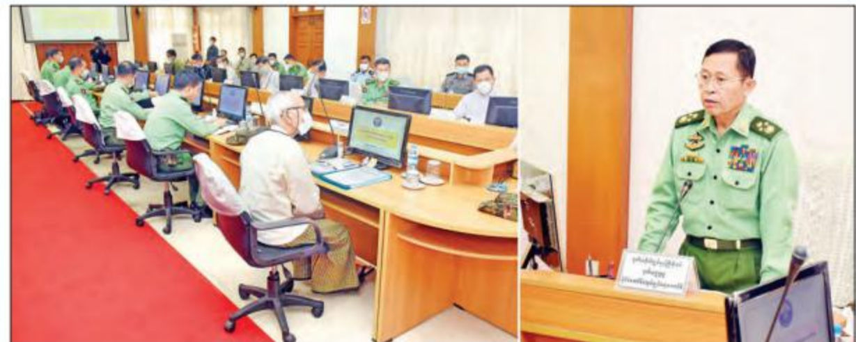
နိုင်ငံတော်စီမံအုပ်ချုပ်ရေးကောင်စီ ဒုတိယဥက္ကဋ္ဌ ဒုတိယတပ်မတော်ကာကွယ်ရေးဦးစီးချုပ်(ကြည်း) ဒုတိယဗိုလ်ချုပ်မှူးကြီး စိုးဝင်း မန္တလေးတိုင်းဒေသကြီး စီမံအုပ်ချုပ်ရေးကောင်စီဥက္ကဋ္ဌနှင့် အဖွဲ့ဝင်များအား တွေ့ဆုံအမှာစကားပြောကြားစဉ်။

များနှင့်ပတ်သက်၍လည်းကောင်း၊ ရပ်ရွာတည်ငြိမ်ရေးနှင့် ပတ်သက်၍ မြန်မာနိုင်ငံ ရဲတပ်ဖွဲ့၊ တပ်မတော်၊ အုပ်ချုပ်ရေးဆိုင်ရာ အဖွဲ့အစည်းများ၊ တည်ငြိမ်အေးချမ်းမှုကို လိုလားသည့် ပြည်သူများ ပူးပေါင်းဆောင်ရွက်ရန် ကိစ္စရပ်များ၊ မြို့နယ်နှင့် ရပ်ကွက်များအတွင်း အကြမ်းဖက်သူများ စီမံဝင်လှုပ်ရှားမှုမရှိစေရေး အသေးစိတ်စစ်ဆေး ဆောင်ရွက်ရန် ကိစ္စရပ်များ၊ CDM လှုပ်ရှားမှု၊ CRPH လှုပ်ရှားမှုနှင့် အကြမ်းဖက်လှုပ်ရှားမှုများကို ဦးစီးဦးဆောင်ဆောင်ရွက်နေသူများအား အမြန်ဆုံး ဖမ်းဆီးရမိအောင်ဆောင်ရွက်ရန်နှင့် ဖမ်းဆီးရမိပါက ဥပဒေအရ ထိရောက်လျင်မြန်စွာ အရေးယူဆောင်ရွက်ရန် လိုအပ်သည့် အခြေအနေများကို ပြောကြားသည်။