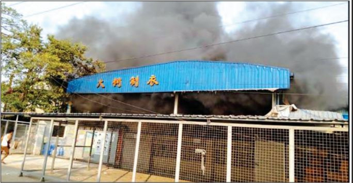
လှိုင်သာယာရှိ စက်ရုံတစ်ရုံကို အကြမ်းဖက်ဆူပူဆန္ဒပြသူများက မီးရှို့ဖျက်ဆီးထားမှုကို တွေ့ရစဉ်။

ရဲရဲတောက်သတင်းဌာနမှ အယ်ဒီတာချုပ် အမတ်ဒိန်က ကျောင်းများ ပြန်ဖွင့်ရန်အတွက် ဆရာ