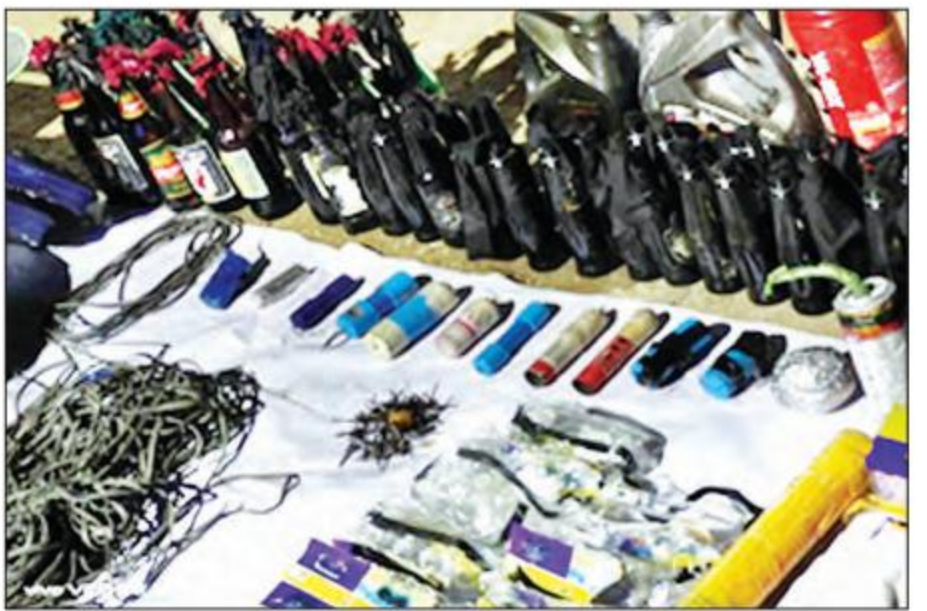
တောင်ကြီးမြို့နယ်၌ ဆူပူအကြမ်းဖက်ဆန္ဒပြသူများထံမှ သိမ်းဆည်းရမိသည့် ပစ္စည်းများ။