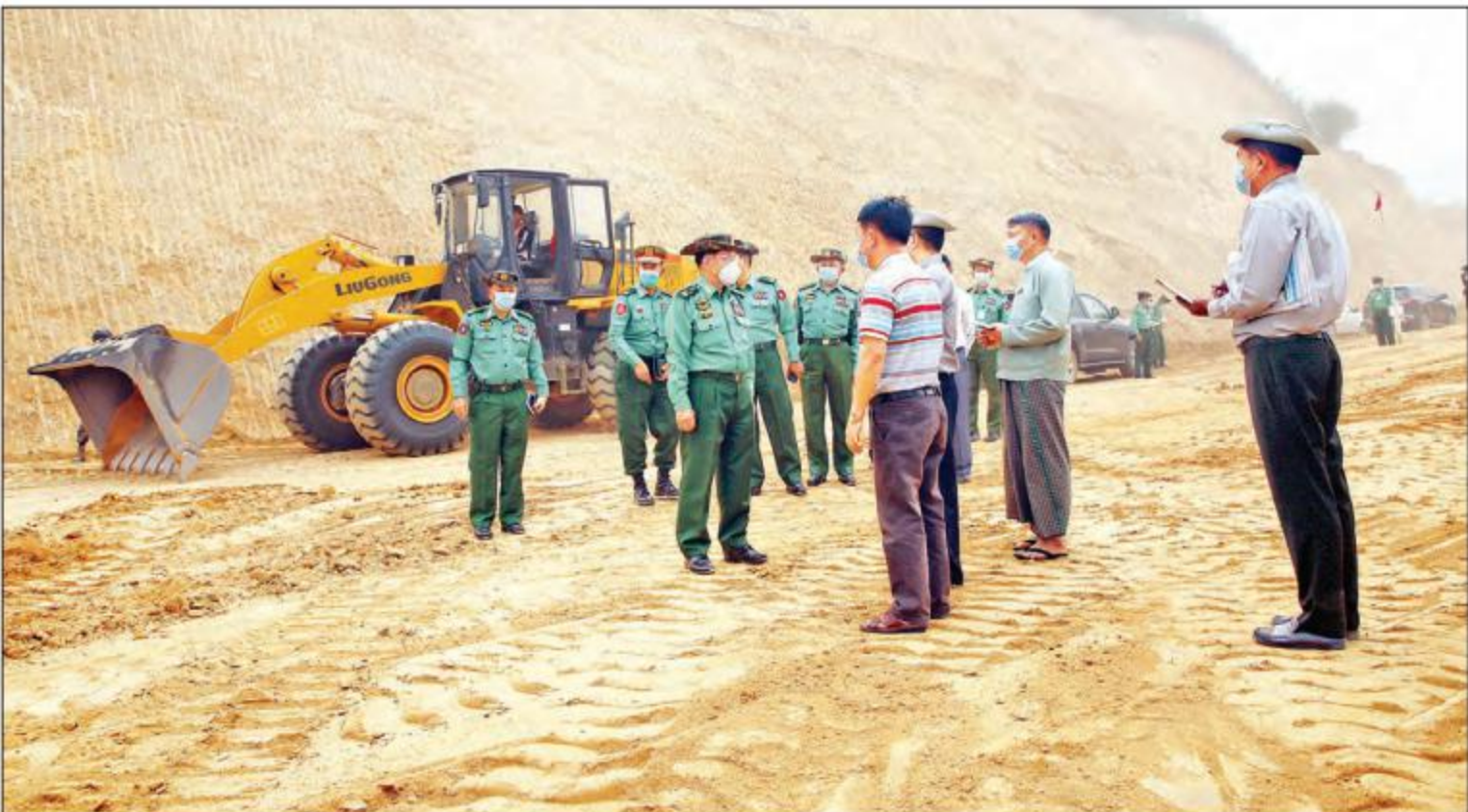
နိုင်ငံတော်စီမံအုပ်ချုပ်ရေးကောင်စီဥက္ကဋ္ဌ၊ တပ်မတော်ကာကွယ်ရေးဦးစီးချုပ် ဗိုလ်ချုပ်မှူးကြီး မင်းအောင်လှိုင် ကျိုင်းတုံမြို့ရှောင်လမ်း ဖောက်လုပ်နေမှုအခြေအနေများအား ကြည့်ရှုစစ်ဆေးစဉ်

နေပြည်တော် မတ် ၂၉ နိုင်ငံတော် စီမံအုပ်ချုပ်ရေး ကောင်စီဥက္ကဋ္ဌ၊ တပ်မတော် ကာကွယ်ရေးဦးစီးချုပ် ဗိုလ်ချုပ် မှူးကြီး မင်းအောင်လှိုင်သည် ယနေ့ညနေပိုင်းတွင် နိုင်ငံတော် စီမံအုပ်ချုပ်ရေး ကောင်စီဝင်များ ဖြစ်ကြသည့် ဒုတိယဗိုလ်ချုပ်ကြီး မိုးမြင့်ထွန်းနှင့် ဦးစိုင်းလုံးဆိုင်၊ ကောင်စီ တွဲဖက်အတွင်းရေးမှူး ဒုတိယဗိုလ်ချုပ်ကြီး ရဲဝင်းဦး၊ ကာကွယ်ရေးဦးစီးချုပ် (ရေ) ဗိုလ်ချုပ်ကြီး မိုးအောင်၊ ကာကွယ် ရေးဦးစီးချုပ်ရုံးမှ တပ်မတော် အရာရှိကြီးများ၊ ကြိုဂဒေသ တိုင်းစစ်ဌာနချုပ် တိုင်းမှူး ဗိုလ်မှူးချုပ် မျိုးမင်းထွန်းတို့ လိုက်ပါ၍ ကျိုင်းတုံမြို့ရှောင် လမ်းဖောက်လုပ်နေမှုအခြေအနေ များအား သွားရောက်ကြည့်ရှု စစ်ဆေးသည်။