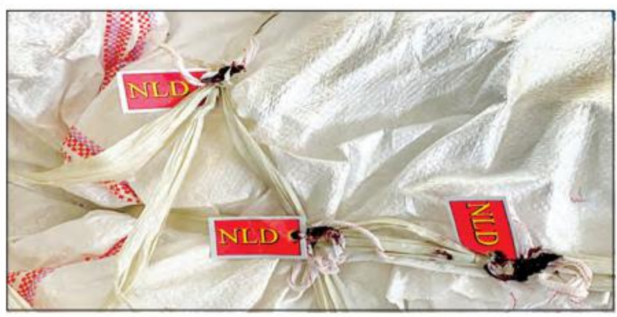
ရေစကြိုမြို့နယ်၊ ဆန္ဒမဲ (၅) အိတ်တွင် (NLD) အမှတ်တံဆိပ်ပါ Label ကတ်ပြားအား သံကွင်းဖြင့် ဖောက်ကာ ဆန္ဒမဲလက်မှတ်အိတ် ချည်သောကြိုးဖြင့်တွဲ၍ ချုပ်ပိတ်လျက်တွေ့ရှိရခြင်း