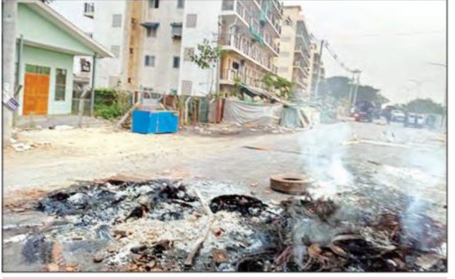
ရဲစခန်းမှ အရာရှိတစ်ဦးအား ဆူပူအကြမ်းဖက်သူလူအုပ်စုက ဖမ်းဆီး၍ ရက်စက်ယုတ်မာစွာ တာယာ ကွင်းများစွပ်၍ မီးရှို့သတ်ဖြတ်ထားမှုကို တွေ့ရစဉ်။

ဆိုင်ကယ်အား နောက်သို့ပြန်လှည့် မောင်းနှင်စဉ် ဆိုင်ကယ်လဲကျခဲ့ပြီး ဆူပူလူအုပ်စု၏ ဖမ်းဆီးခြင်း ခံခဲ့ရကာ တာယာကွင်းများဖြင့် စွပ်၍ အရှင်လတ်လတ် မီးရှို့သတ် ခံခဲ့ရကြောင်း သိရှိရသည်။ ရရှိသတင်းအရ လုံခြုံရေး တပ်ဖွဲ့ဝင်များက မြေပြင်သွား ရောက်ရှင်းလင်းခဲ့ရာ မီးလောင် ကျွမ်းထားသည့် ကိုယ်ခန္ဓာအစိတ် အပိုင်းအချို့နှင့် ၎င်းအရာရှိ စီးနင်းသွားသည့် ဆိုင်ကယ်နံပါတ် ပြားအားတွေ့ရှိခဲ့ပြီး ခြောက်လုံး ပြူးသေနတ် တစ်လက်နှင့် ဆက်သွယ်ရေးစက်မှာ ပျောက် ဆုံးလျက်ရှိကြောင်း။ လုံခြုံရေး တပ်ဖွဲ့ဝင်များမှ ဆက်လက်သတင်းဖော်ထုတ်ချက် အရ ဆူပူအကြမ်းဖက်အဖွဲ့