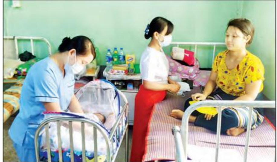
တောင်ငူမြို့ တပ်မတော်ဆေးရုံ၌ ဒေသခံပြည်သူများအား ဆေးဝါးကုသပေးစဉ်။

နေပြည်တော် မတ် ၂၉ တိုင်းဒေသကြီးနှင့် ပြည်နယ်များရှိ တိုင်းရင်းသား ပြည်သူများအတွက် တပ်မတော်ဆေးရုံများနှင့် ယာယီကုသရေးဆေးရုံများတွင် ကျန်းမာရေး စောင့်ရှောက်မှုများကို ဆောင်ရွက်ပေးလျက်ရှိရာ ဖေဖော်ဝါရီ ၅ ရက်မှ ယနေ့အထိ ပြင်ပလူနာ ၁၀၂၂၃ ဦး၊ အတွင်းလူနာ ၄၁၈၁ ဦးကို တပ်မတော်မှ ပါရဂူများ၊ ဆေးမှူးများ၊ သူနာပြုများဖြင့် ကျန်းမာရေး စစ်ဆေးပေးခြင်း၊ ခွဲစိတ်ရန်လိုအပ်သည့်လူနာများ အား ခွဲစိတ်ပေးခြင်း၊ ဆေးရုံတက်ရောက်ကုသရန် လိုအပ်သောလူနာများကိုဆေးရုံတင်ကာ ကျန်းမာရေး စောင့်ရှောက်ပေးခြင်းများ ဆောင်ရွက်ပေးသည့် အပြင် ဆေးရုံတက်လူနာများနှင့် လူနာစောင့်ရှောက် မှုအဖွဲ့ဝင်များအား အဆင်ပြေစေရန်အတွက်ပါ စီမံဆောင်ရွက်ပေးလျက်ရှိသည်။ ထိုသို့ လာရောက်ကုသမှုခံယူလျက်ရှိသည့် လူနာများအနက် အကြီးစားခွဲစိတ်ကုသရန်လိုအပ်သူ ၄၇၈၅ ဦး၊ အသေးစားခွဲစိတ်ကုသရန်လိုအပ်သူ