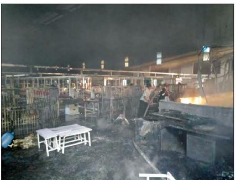
လှိုင်သာယာရှိ စက်ရုံများအား အကြမ်းဖက်ဆူပူဆန္ဒပြသူများက မီးရှို့ဖျက်ဆီးမှုကို တွေ့ရစဉ်။