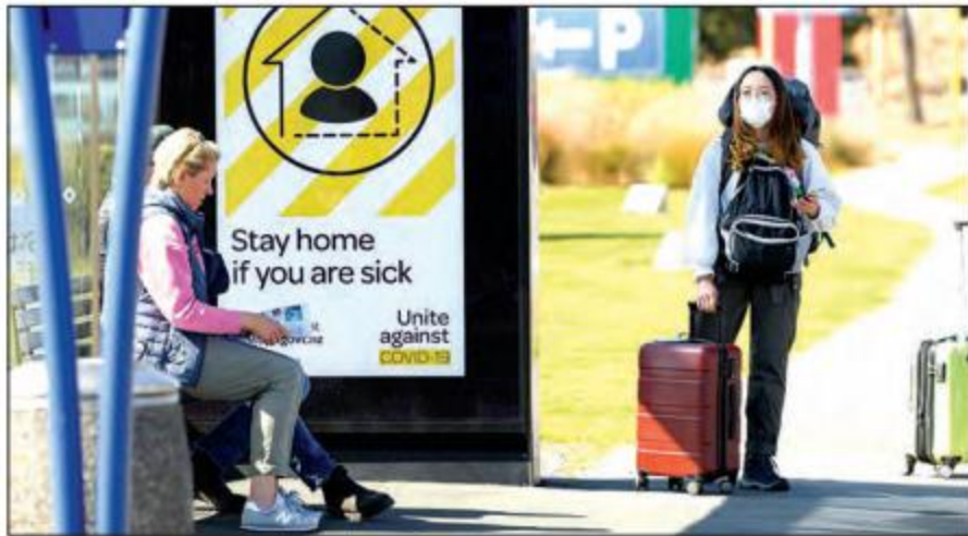
နယူးဇီလန်နိုင်ငံ ခရစ်ချင်မြို့ရှိ လေဆိပ်တစ်ခု၌ နားနေရာအနီး စောင့်ဆိုင်းနေကြသူများကို တွေ့ရစဉ်။

လုပ်ငန်းထက်ဝက်နီးပါးမှာ ယခင်လိုမဟုတ်ဘဲ ဝေးကွာသောအရပ်မှ ဝန်ထမ်းများ အလုပ်လုပ်ကြ ရန် ပြောင်းလဲခဲ့ရသည်။ စီးပွားရေးလုပ်ငန်းများ လေးပုံပုံ တစ်ပုံမှာ အွန်လိုင်းပေါ်မှတစ်ဆင့် ကုန်ပစ္စည်းရောင်းချသည့်လုပ်ငန်းကို ပြောင်းလဲ