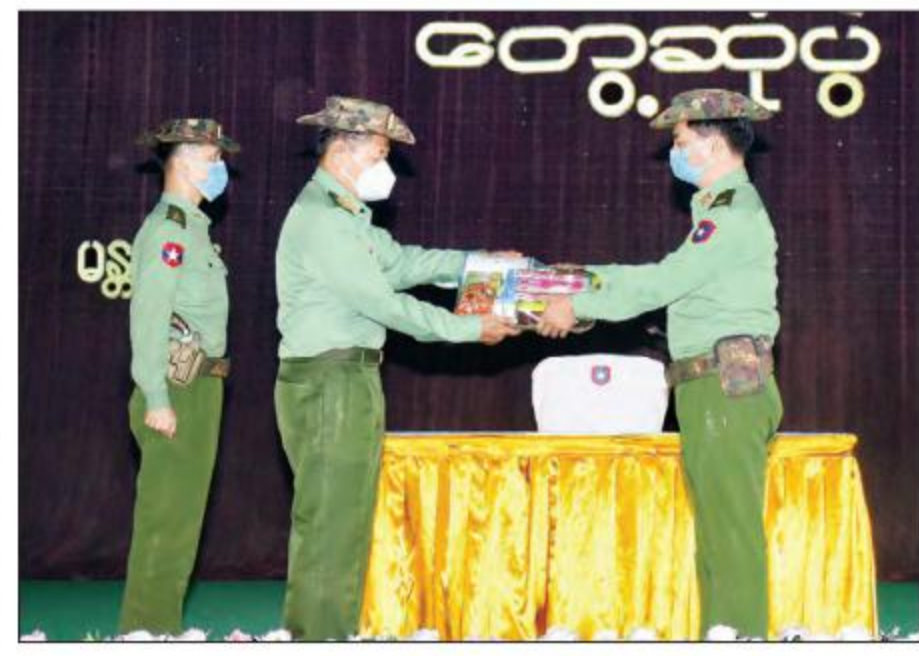
နိုင်ငံတော်စီမံအုပ်ချုပ်ရေးကောင်စီ ဒုတိယဥက္ကဋ္ဌ ဒုတိယတပ်မတော်ကာကွယ်ရေးဦးစီးချုပ် ကာကွယ်ရေးဦးစီးချုပ်(ကြည်း) ဒုတိယဗိုလ်ချုပ်မှူးကြီး စိုးဝင်း မန္တလေးတပ်နယ်မှ အရာရှိ၊ စစ်သည်၊ မိသားစုဝင်များအတွက် လက်ဆောင်ပစ္စည်းများနှင့် ချီးမြှင့်ငွေများ ပေးအပ်စဉ်။

နိုင်ငံတော်စီမံအုပ်ချုပ်ရေးကောင်စီ ဒုတိယဥက္ကဋ္ဌ ဒုတိယတပ်မတော်ကာကွယ်ရေးဦးစီးချုပ် ကာကွယ်ရေးဦးစီးချုပ်(ကြည်း) က ၂၀၂၀ ပြည့်နှစ်၊ အထွေထွေရွေးကောက်ပွဲတွင် ၁၀ ဒသမ ၄ သန်းကျော် သံသယဖြစ်ဖွယ် မဲစာရင်းမှားယွင်းမှုများကို သက်ဆိုင်ရာ ရွေးကောက်ပွဲကော်မရှင်က ဖြေရှင်းပေးမှု မရှိသည့်အပြင် လွှတ်တော်၊ NLD အစိုးရအဖွဲ့မှ ငြင်းပယ်ခဲ့သည့် အခြေအနေများ၊ အမျိုးသားကာကွယ်ရေးနှင့် လုံခြုံရေးကောင်စီခေါ်ယူ၍ ဖြေရှင်းဆောင်ရွက်ပေးရန် တောင်းဆိုခဲ့မှုကို ငြင်းပယ်ခဲ့သည့် အခြေအနေများ၊ နိုင်ငံတော်၏အာဏာအရပ်ရပ်ကို အဓမ္မနည်းဖြင့် ရယူရန် ကြိုးပမ်း လာမှုကြောင့် တပ်မတော်အနေဖြင့် ဖွဲ့စည်းပုံအခြေခံဥပဒေ (၂၀၀၈ ခုနှစ်) ပါ ပေးအပ်ထားသည့် တာဝန်များအရ နိုင်ငံတော်၏ တာဝန်အရပ်ရပ်ကို ၂၀၂၁ ခုနှစ်၊ ဖေဖော်ဝါရီ ၁ ရက်မှစတင်၍ ထိန်းသိမ်းဆောင်ရွက်ခဲ့သည့် အခြေအနေများ၊ ဖွဲ့စည်းပုံအခြေခံဥပဒေမှ သတ်မှတ်ပြဋ္ဌာန်းထားသည့် ကာလများအတွင်း နိုင်ငံတော်စီမံအုပ်ချုပ်ရေးကောင်စီ ဖွဲ့စည်း