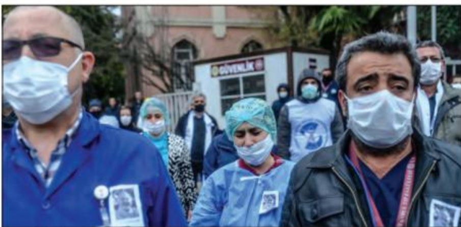
တူရကီကျန်းမာရေးဝန်ထမ်းများကို တွေ့ရစဉ်။

သေဆုံးသူ စုစုပေါင်း ၃၁၀၇၆ ဦး အထိရှိလာခဲ့သည်။ ပြန်လည်ကျန်းမာလာသူ အရေအတွက်မှာလည်း ၂၉၅၇၀၉၃ ဦးအထိရှိလာသည်။ တူရကီနိုင်ငံသည် ဇန်နဝါရီ ၁၄ ရက်မှစတင်ကာ ကိုဗစ်-၁၉ ကာကွယ်ဆေးအစုလိုက် ထိုးနှံခြင်း လုပ်ငန်းများစတင်ခဲ့သည်။ ပြီးခဲ့သည့် ရက်ပိုင်းအတွင်း လူပေါင်း ၂၅၀၀၉ ဦးကို ဆေးစစ်