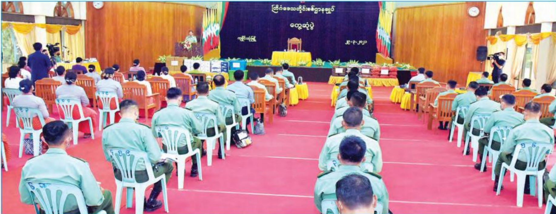
နိုင်ငံတော်စီမံအုပ်ချုပ်ရေးကောင်စီဥက္ကဋ္ဌ၊ တပ်မတော်ကာကွယ်ရေးဦးစီးချုပ် ဗိုလ်ချုပ်မှူးကြီး မင်းအောင်လှိုင် ကျိုင်းတုံတပ်နယ်မှ အရာရှိ၊ စစ်သည်၊ မိသားစုများအား တွေ့ဆုံအမှာစကားပြောကြားစဉ်။ သတင်းစဉ်

တိုင်းပြည်တိုးတက်ကောင်းမွန်ရေးကိုသာ အဓိကလိုလားပြီး မည်သည့် အစိုးရတက်လာသည်ဖြစ်စေ အတူတကွလက်တွဲ၍ နိုင်ငံ၏ ကောင်းရာကောင်းကျိုးများကို ကြိုးပမ်းဆောင်ရွက်သွားမည်