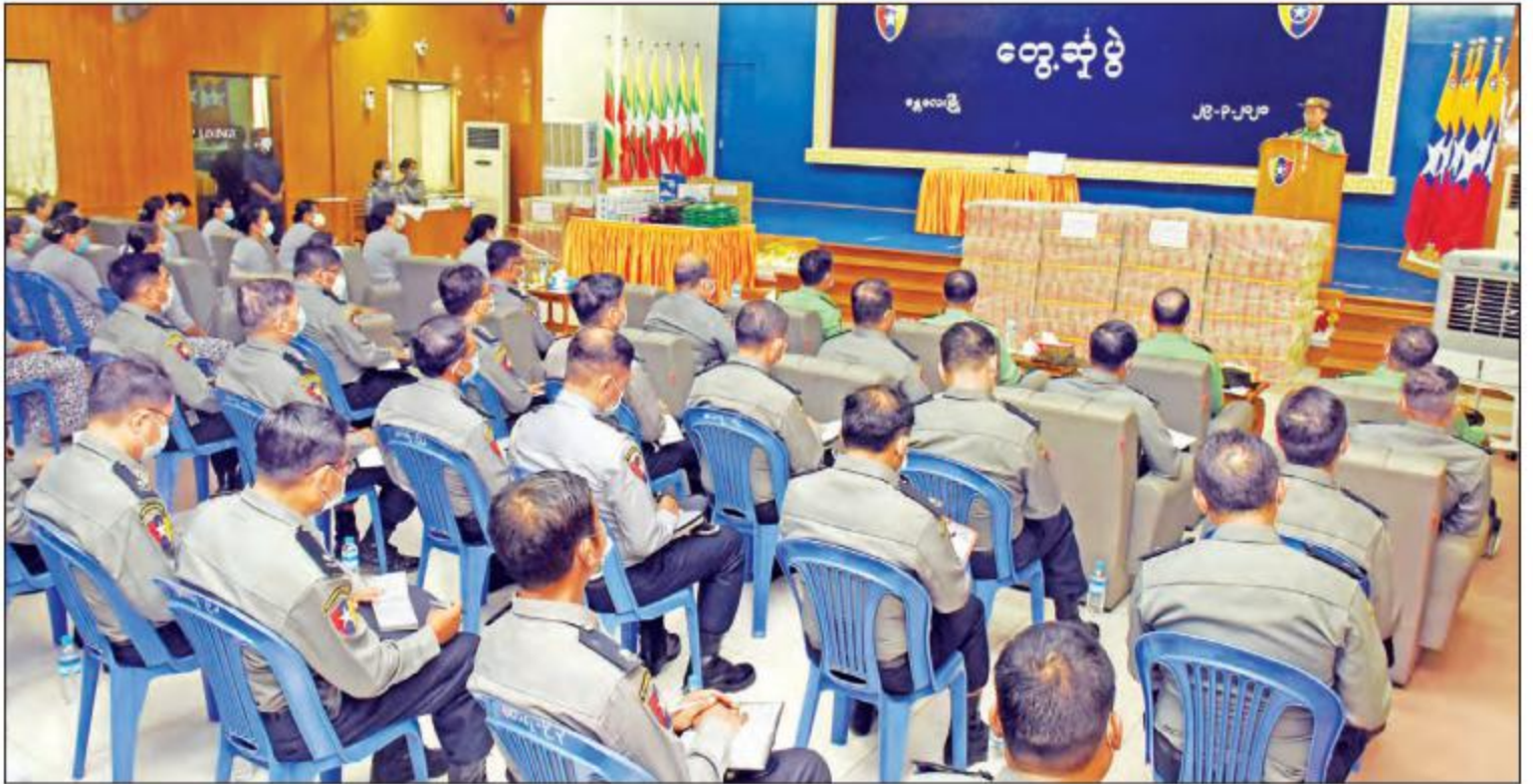
နိုင်ငံတော်စီမံအုပ်ချုပ်ရေးကောင်စီ ဒုတိယဥက္ကဋ္ဌ ဒုတိယတပ်မတော်ကာကွယ်ရေးဦးစီးချုပ် ကာကွယ်ရေးဦးစီးချုပ်(ကြည်း) ဒုတိယဗိုလ်ချုပ်မှူးကြီး စိုးဝင်း မန္တလေးတိုင်းဒေသကြီးရဲတပ်ဖွဲ့မှူးရုံးမှ မြန်မာနိုင်ငံရဲတပ်ဖွဲ့ဝင်များနှင့် မိသားစုများအား တွေ့ဆုံ အမှာစကားပြောကြားစဉ်။

နေပြည်တော် မတ် ၂၉ နိုင်ငံတော် စီမံအုပ်ချုပ်ရေးကောင်စီ ဒုတိယဥက္ကဋ္ဌ ဒုတိယတပ်မတော်ကာကွယ်ရေး ဦးစီးချုပ် ကာကွယ်ရေးဦးစီးချုပ်(ကြည်း) ဒုတိယဗိုလ်ချုပ်မှူးကြီး စိုးဝင်းသည် ယနေ့ မွန်းလွဲပိုင်းတွင် မန္တလေးတပ်နယ်မှ အရာရှိ၊ စစ်သည်၊ မိသားစုများအား ရန်အောင်မြင်ခန်းမ၌ လည်းကောင်း၊ မန္တလေးတိုင်းဒေသကြီးရဲတပ်ဖွဲ့မှူးရုံးမှ မြန်မာနိုင်ငံရဲတပ်ဖွဲ့ဝင်များနှင့် မိသားစုများအား ရဲညွှန်ခန်းမ၌ လည်းကောင်း သီးခြားစီတွေ့ဆုံ၍ အားပေး အမှာစကားပြောကြားသည်။