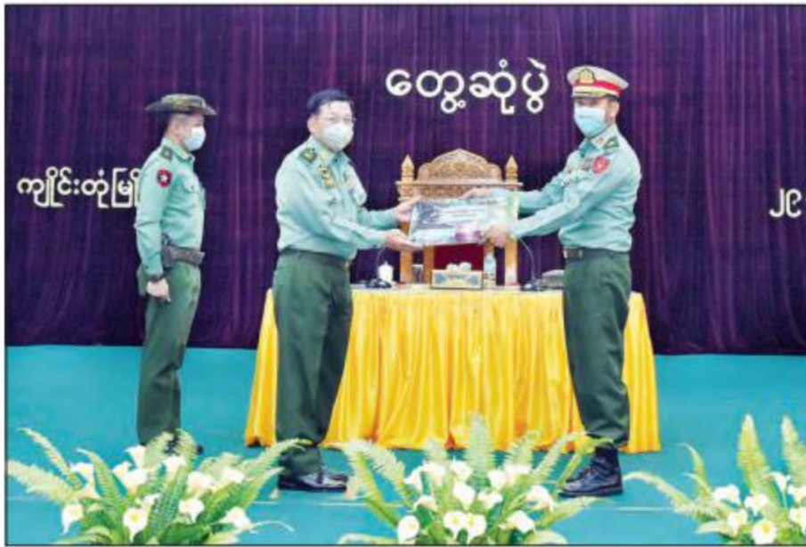
နိုင်ငံတော်စီမံအုပ်ချုပ်ရေးကောင်စီဥက္ကဋ္ဌ၊ တပ်မတော်ကာကွယ်ရေးဦးစီးချုပ် ဗိုလ်ချုပ်မှူးကြီး မင်းအောင်လှိုင်က စားသောက်ဖွယ်ရာပစ္စည်းများနှင့် တပ်မတော်စက်ရုံများမှ ထုတ်လုပ်သည့် လူသုံးကုန်ပစ္စည်းများကိုပေးအပ်ရာ ကြိုဂဒေသတိုင်းစစ်ဌာနချုပ်တိုင်းမှူး လက်ခံရယူစဉ်။