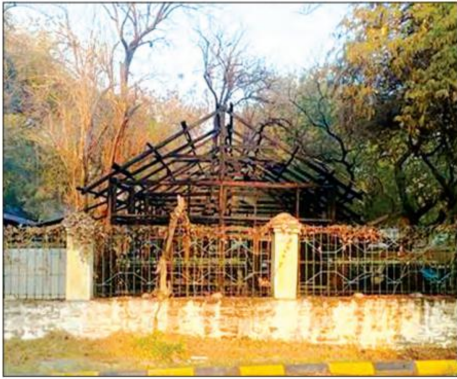
မြင်းခြံမြို့နယ် အထက (၄) ရှိ အဆောက်အအုံတစ်လုံး မီးကွင်းပစ်ခတ်ခံရမှုကြောင့် မီးလောင်ဆုံးရှုံး ပျက်စီးမှုကို တွေ့ရစဉ်။