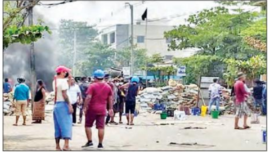
တောင်ဒဂုံမြို့နယ်၌ လမ်းများပိတ်ဆို့၍ ဆူပူအကြမ်းဖက်ဆန္ဒပြသူများအား တွေ့ရစဉ်။