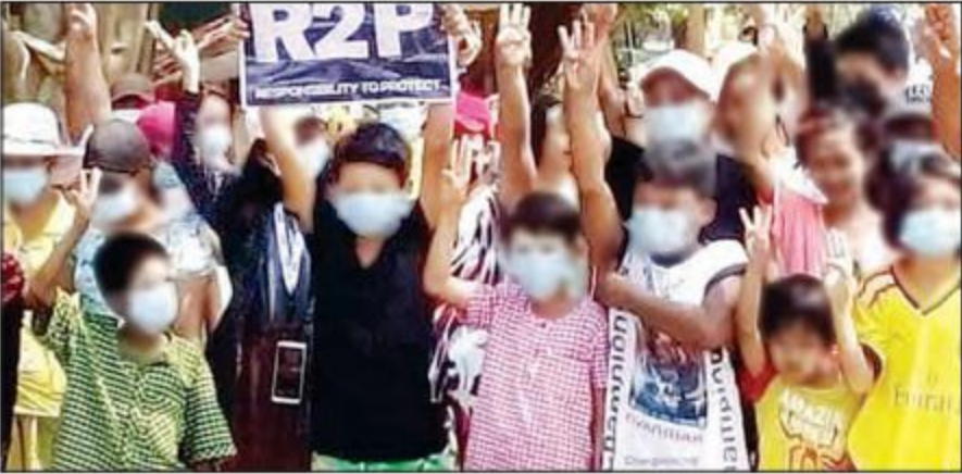
ကလေးငယ်များအား လက်ရှိနိုင်ငံရေးတွင် ကိုယ်ကျိုးအတွက် လွဲမှားစွာ အသုံးပြုနေသည့် ပုံတစ်ပုံကို တွေ့ရစဉ်။

ဤဇာတ်တော် ဇာတ်လမ်းကဲ့သို့ပင် မြန်မာ့ ရုပ်ရှင်၊ ဇာတ်သဘင်ပရိသတ်များအနေဖြင့် ရုပ်ရှင်၊ ဇာတ်သဘင် ဇာတ်လမ်းတစ်ခုခု၏ အဓိကဆိုလိုချင်သည့် ဇာတ်လမ်းအနှစ်သာရကို ခံစားရမည်ထက် ဇာတ်လမ်းတွင် ဇာတ်နာအောင် သရုပ်ဖော်ထားသည့် ဇာတ်လမ်းဇာတ်ကွက်ကိုသာ ပိုမိုခံစား၊ ပိုမိုနှစ်သက် စွဲလမ်းကြပါသည်။ မြန်မာပရိသတ်များအနေဖြင့် ထိုသို့ဇာတ်လမ်းဇာတ်ကွက်များကို ကြည့်ရှုပြီး မည်မျှ စွဲလမ်းကြ၊ ခံစားကြပါသနည်းဆိုလျှင် ဇာတ်နာအောင် ဇာတ်ဝင်ခန်းရောက်သည်နှင့် ရုပ်ရှင်ပိတ်ကားကိုဖြစ်စေ၊ ဇာတ်စင်ကိုဖြစ်စေ အရာဝတ္ထုများနှင့် ပစ်ပေါက်သည်အထိ ရုန်းရင်းဆန်ခတ်ဖြစ်ခဲ့ကြသည်။