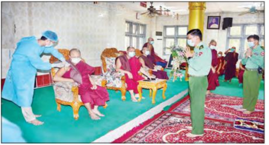
ရန်ကုန်တိုင်းစစ်ဌာနချုပ် တိုင်းမှူး ဗိုလ်ချုပ် ညွှန်ကြားရေးမှူးချုပ် ဦးမြတ်ကြည်ညို အားပေးကြည့်ရှုစဉ်။ သံဃာတော်များ ကိုဗစ်-၁၉ ကာကွယ်ဆေးထိုးပေးနေမှုအား ဖူးမြော်ကြည့်ညို အားပေးကြည့်ရှုစဉ်။

ထိုးနှံပေးခြင်းများဆောင်ရွက်ပေး ကြသည်။ ညှိနှိုင်းဆောင်ရွက် ယင်းသို့ ဆောင်ရွက်ပေးနေမှု များကို ရန်ကုန်တိုင်းစစ်ဌာနချုပ် တိုင်းမှူး ဗိုလ်ချုပ် ညွှန်ကြားရေးမှူးချုပ် ဦးမြတ်ကြည်ညိုပြီး လိုအပ်သည် များ ညှိနှိုင်းဆောင်ရွက်ပေးကာ သံဃာတော်များအား ဆွမ်းဆန် တော်၊ ဆီနှင့် လှူဖွယ်ဝတ္ထု ပစ္စည်းများ ဆက်ကပ်လှူဒါန်းခဲ့ ကြောင်း သတင်းရရှိသည်။ သတင်းစဉ်