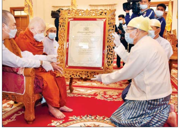
နိုင်ငံတော်ဖွဲ့စည်းပုံအခြေခံဥပဒေဆိုင်ရာခုံရုံးဥက္ကဋ္ဌ ဦးသန်းကျော် အဘိဓမ္မမဟာသဒ္ဓမ္မဇောတိက ဘွဲ့တံဆိပ်တော်ရ ဆရာတော် ဘဒ္ဒန္တသိဒ္ဓိယ အား ဘွဲ့တံဆိပ်ဆက်ကပ်စဉ်။

တော် ဆက်ကပ်ပူဇော်ပွဲ အခမ်း အနားတွင် အဘိဓမ္မမဟာရဋ္ဌဂုရု ဘွဲ့တံဆိပ်တော်ရ ဆရာတော်ကြီး (၁၃) ပါးနှင့် အဘိဓမ္မ အဂ္ဂမဟာ သဒ္ဓမ္မဇောတိက ဘွဲ့တံဆိပ်တော်ရ ဆရာတော်ကြီး (၇) ပါးတို့အား သာသနာတော်ဆိုင်ရာ ဘွဲ့တံဆိပ် များကို ဆက်ကပ်ခဲ့ကြောင်း သိရသည်။ သတင်းစဉ်