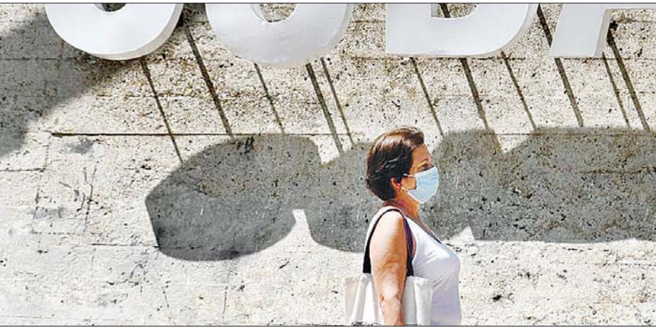
ပါးစပ်နှာခေါင်းစည်းတပ်ဆင်ထားသည့် အမျိုးသမီးတစ်ဦး ကျူးဘားနိုင်ငံ မြို့တော် ဟာဗာနာတွင် လမ်းလျှောက်နေသည်ကို တွေ့ရစဉ်။

ပြည်သူ့ကျန်းမာရေးဝန်ကြီး ဌာန တစ်ကိုယ်ရေနှင့်ပတ်ဝန်း ကျင်သန့်ရှင်းရေးနှင့် ကူးစက်မှု ဆိုင်ရာညွှန်ကြားရေးမှူး ဖရန်စစ် စကိုဒရန်က နေ့စဉ်ထုတ်လွှင့်ချက် တွင် ကိုဗစ်-၁၉ ထပ်မံကူးစက် ဖြစ်ပွားသူ ၈၀၅ ဦး ရှိကြောင်း အတည်ပြုဖော်ပြခဲ့သည်။ အဆိုပါ ပမာဏသည် လက်တင်အမေရိက နိုင်ငံတစ်နိုင်ငံတွင် ကူးစက်မှု အမြင့်ဆုံး ဖြစ်ကြောင်း သိရသည်။