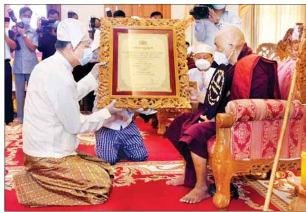
နိုင်ငံတော်စီမံအုပ်ချုပ်ရေးကောင်စီဝင် ဗိုလ်ချုပ်ကြီး မြထွန်းဦး အဘိဓဇမဟာရဋ္ဌဂုရု ဘွဲ့တံဆိပ်တော်ရ ဆရာတော် ဘဒ္ဒန္တသုရိယ အား ဘွဲ့တံဆိပ်ဆက်ကပ်စဉ်။