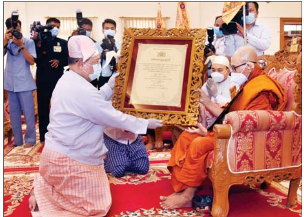
နိုင်ငံခြားရေးဝန်ကြီးဌာန ပြည်ထောင်စုဝန်ကြီး ဦးဝဏ္ဏမောင်လွင် အဘိဓမ္မမဟာရဋ္ဌဂုရု ဘွဲ့တံဆိပ်တော်ရ ဆရာတော် ဘဒ္ဒန္တဝိသုတ အား ဘွဲ့တံဆိပ်ဆက်ကပ်စဉ်။