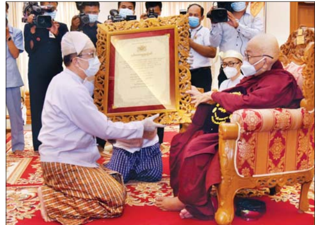
စီမံကိန်း၊ ဘဏ္ဍာရေးနှင့် စက်မှုဝန်ကြီးဌာန ပြည်ထောင်စုဝန်ကြီး ဦးဝင်းရှိန် အဘိဓမ္မမဟာရဋ္ဌဂုရု ဘွဲ့တံဆိပ်တော်ရ ဆရာတော် ဒေါက်တာ ဘဒ္ဒန္တအင်္ဂိသ အား ဘွဲ့တံဆိပ်ဆက်ကပ်စဉ်။