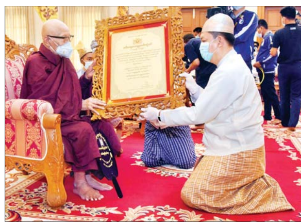
နိုင်ငံတော်စီမံအုပ်ချုပ်ရေးကောင်စီဝင် ဒုတိယဗိုလ်ချုပ်ကြီး မိုးမြင့်ထွန်း အဘိဓဇအဂ္ဂမဟာ သဒ္ဓမ္မဇောတိက ဘွဲ့တံဆိပ်တော်ရ ဆရာတော် ဘဒ္ဒန္တစန္ဒသိရိ အား ဘွဲ့တံဆိပ်ဆက်ကပ်စဉ်။