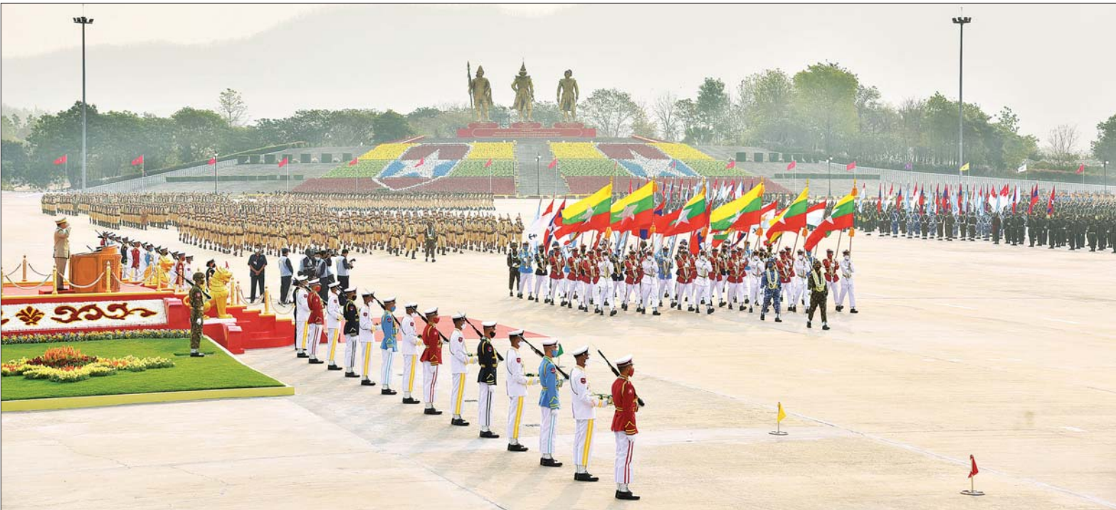
နိုင်ငံတော်စီမံအုပ်ချုပ်ရေးကောင်စီဥက္ကဋ္ဌ တပ်မတော်ကာကွယ်ရေးဦးစီးချုပ် ဗိုလ်ချုပ်မှူးကြီး မင်းအောင်လှိုင် စစ်ရေးပြစစ်ကြောင်းကြီးများ၏ အလေးပြုမှုကို ခံယူစဉ်။

စစ်ကြောင်းမှူး ဗိုလ်မှူးချုပ် ထွန်းနိုင်ဦး ဦးဆောင်သည့် ဂုဏ်ပြုတပ်ခွဲ၊ တပ်မတော် (ကြည်း) (၁၉၇၃-၁၉၈၈)တပ်ခွဲ၊ တပ်မတော် (ရေ) (၁၉၇၃-၁၉၈၈) တပ်ခွဲ၊ တပ်မတော်(လေ) (၁၉၇၃- ၁၉၈၈) တပ်ခွဲ၊ တပ်မတော် (ကြည်း) (၁၉၈၉-၁၉၉၉) တပ်ခွဲ။