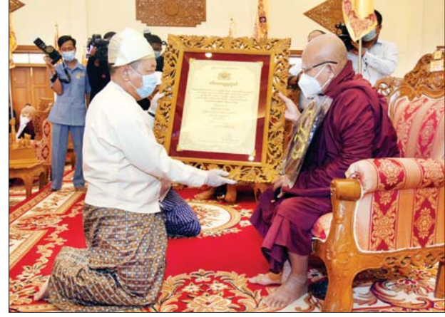
ပြည်ထဲရေးဝန်ကြီးဌာန ပြည်ထောင်စုဝန်ကြီး ဒုတိယဗိုလ်ချုပ်ကြီး စိုးထွဋ် အဘိဓမ္မမဟာရဋ္ဌဂုရု ဘွဲ့တံဆိပ်တော်ရ ဆရာတော် ဘဒ္ဒန္တ သောမ အား ဘွဲ့တံဆိပ်ဆက်ကပ်စဉ်။