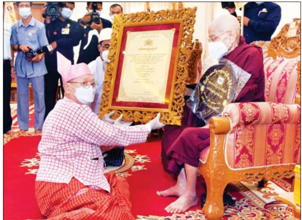
နိုင်ငံတော်စီမံအုပ်ချုပ်ရေးကောင်စီဝင် ဒေါက်တာ ဗညားအောင်မိုး အဘိဓမ္မဟာရဋ္ဌဂုရု ဘွဲ့တံဆိပ်တော်ရ ဆရာတော် ဘဒ္ဒန္တဝါသေဋ္ဌ အား ဘွဲ့တံဆိပ်ဆက်ကပ်စဉ်။