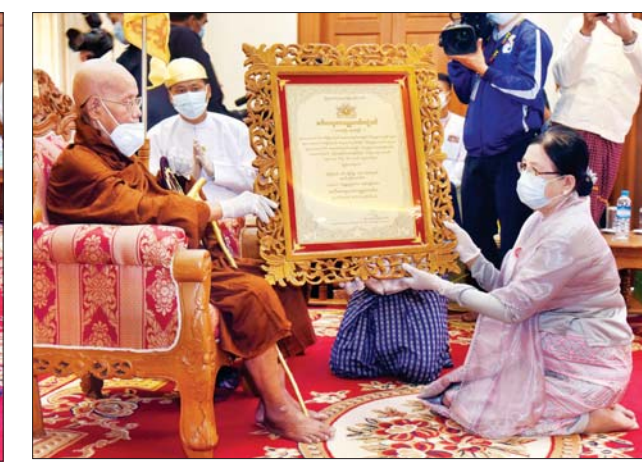
နိုင်ငံတော်စီမံအုပ်ချုပ်ရေးကောင်စီဝင် ဒေါ်အေးနုစိန် အဘိဓဇ အဂ္ဂမဟာသဒ္ဓမ္မဇောတိက ဘွဲ့တံဆိပ်တော်ရ ဆရာတော် ဘဒ္ဒန္တ ပညာဝံသ အား ဘွဲ့တံဆိပ်ဆက်ကပ်စဉ်။