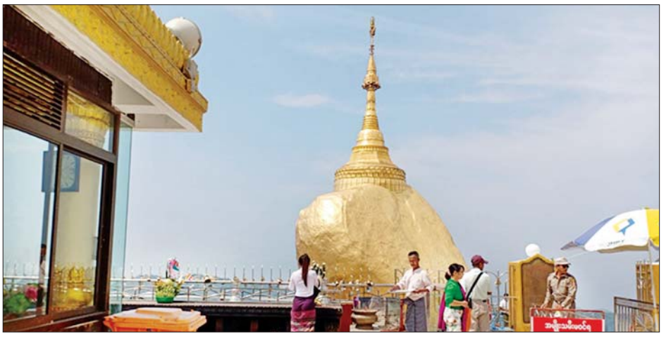
သတင်းစဉ်

ထို့ပြင် သက်ဆိုင်ရာ ဘာသာရေးကျောင်းများတွင်လည်း ဘာသာဝင်များက စိတ်အေးချမ်းသာစွာ လာရောက်ဝတ်ပြုလျက်ရှိကြကြောင်း သတင်းရရှိသည်။