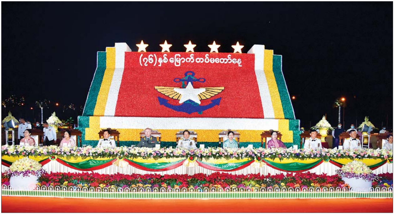
(၇၆)နှစ်မြောက် တပ်မတော်နေ့ အထိမ်းအမှတ်ညွှန်ပွဲနှင့် ဂုဏ်ပြုညစာစားပွဲအခမ်းအနားတွင် နိုင်ငံတော်စီမံအုပ်ချုပ်ရေးကောင်စီဥက္ကဋ္ဌ တပ်မတော်ကာကွယ်ရေးဦးစီးချုပ် ဗိုလ်ချုပ်မှူးကြီး မင်းအောင်လှိုင်နှင့်ဇနီး ဒေါ်ကြူကြူလှနှင့် တက်ရောက်ကြသူများကို တွေ့ရစဉ်။ သတင်းစဉ်

ရင်းရင်းနှီးနှီး နှုတ်ဆက် ကာကွယ်ရေးဦးစီးချုပ်ရုံး (ကြည်း၊ ရေးလေ)မှ တပ်မတော်အရာရှိကြီးများနှင့် ဇနီးများ၊ လွတ်လပ်ရေးမော်ကွန်းဝင်ပထမအဆင့်၊ ဒုတိယအဆင့်နှင့်တတိယအဆင့်မော်ကွန်းဝင်ပုဂ္ဂိုလ်များ၊ တပ်မတော် (ကြည်း၊ ရေး လေ) အငြိမ်းစားအရာရှိကြီးများ၊ အငြိမ်းစား တပ်မတော်ကာကွယ်ရေး ဦးစီးချုပ်များ၏ မိသားစုဝင်များ၊ ပြည်ထောင်စုတရား လွှတ်တော်ချုပ်တရားသူကြီးများ၊ နိုင်ငံတော်ဖွဲ့စည်းပုံအခြေခံဥပဒေဆိုင်ရာ ခုံရုံးအဖွဲ့ဝင်များနှင့် ပြည်ထောင်စုရွေးကောက်ပွဲကော်မရှင်အဖွဲ့ဝင်များ၊ တစ်နိုင်လုံး ပစ်ခတ်တိုက်ခိုက်မှု ရပ်စဲရေးသဘောတူစာချုပ် NCA လက်မှတ်ရေးထိုးထားသည့် တိုင်းရင်းသားလက်နက်ကိုင်အဖွဲ့များမှ ကိုယ်စားလှယ်များ၊ နေပြည်တော်ကောင်စီဝင်များ၊ အောင်ဆန်းသူရိယာဘွဲ့ရရှိခဲ့သူများ၏ မိသားစုဝင်များနှင့် ဆွေမျိုးများ၊ သူရဉာဏ်နှင့် တပ်မတော်စွမ်းရည်သတ္တိဆိုင်ရာ ဂုဏ်ထူးဆောင်ဘွဲ့ တံဆိပ်ရရှိခဲ့ကြသည့် အရာရှိစစ်သည်များနှင့်မိသားစုဝင်များ၊ ဆွေမျိုးများ၊ အသွင်ပြောင်းပြည်သူ့စစ်၊ မူလပြည်သူ့စစ်နှင့် နယ်ခြားစောင့် ဗဟိုအကြံပေးကွပ်ကဲရေးအဖွဲ့များ၊ နိုင်ငံခြားစစ်သံရုံးများမှ စစ်သံမှူးများနှင့် တာဝန်ရှိသူများ၊ အငြိမ်းစားသံအမတ်ကြီးများ၊ ဝန်ကြီးဌာနအသီးသီးမှ ညွှန်ကြားရေးမှူးချုပ်၊ ဦးဆောင်ညွှန်ကြားရေးမှူးချုပ်၊ စစ်ရေးပြအခမ်းအနားတွင် ပါဝင်ခဲ့သည့် စစ်ရေးပြမှူး၊ စစ်ကြောင်းမှူးများ၊ ဝန်ကြီးဌာန အသီးသီးတွင် တာဝန်ထမ်းဆောင်ခဲ့ကြ