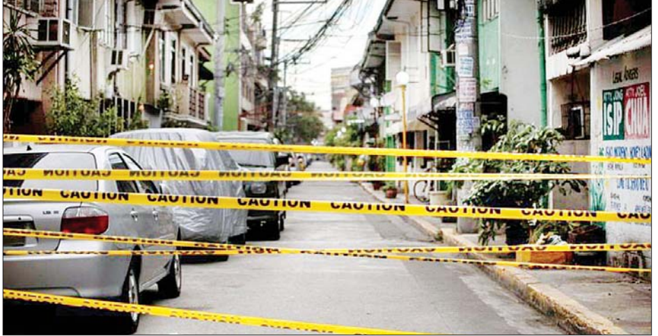
ဖိလစ်ပိုင်နိုင်ငံ မြို့တော်မနီလာတွင် ကိုဗစ်-၁၉ ကူးစက်မှုမြင့်တက်နေသည့်အတွက် ကျေးရွာတစ်ရွာရှိ လမ်းတစ်ခုပေါ်တွင် ကိုဗစ်-၁၉ တားဆီး ကာကွယ်မှုပြုလုပ်ထားသည့် အတားအဆီးများကို တွေ့ရစဉ်။