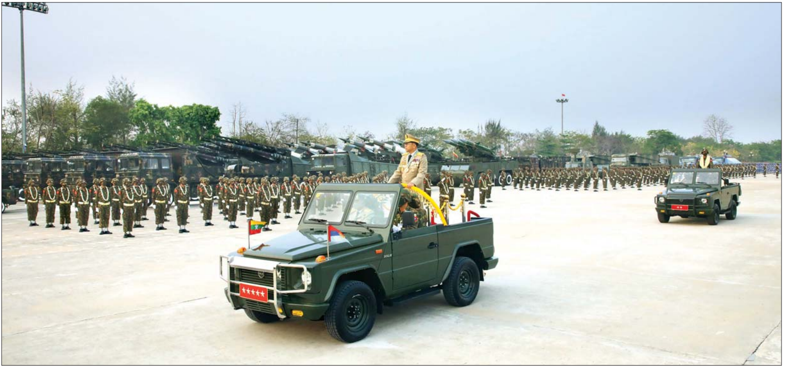
နိုင်ငံတော်စီမံအုပ်ချုပ်ရေးကောင်စီဥက္ကဋ္ဌ တပ်မတော်ကာကွယ်ရေးဦးစီးချုပ် ဗိုလ်ချုပ်မှူးကြီး မင်းအောင်လှိုင် စစ်ရေးပြစစ်ကြောင်းကြီးများအား လိုက်လံစစ်ဆေးစဉ်။

နိုင်ငံတော်စီမံ အုပ်ချုပ်ရေး ကောင်စီဥက္ကဋ္ဌ တပ်မတော် ကာကွယ်ရေးဦးစီးချုပ် ဗိုလ်ချုပ်မှူးကြီး မဟာသရေစည်သူ မင်းအောင်လှိုင်သည် တပ်မတော် နေ့စစ်ရေးပြအခမ်းအနားကျင်းပ သည့် စစ်ရေးပြကွင်းသို့ ရောက်ရှိ ပြီး အလေးပြုခံစင်မြင့်၌ နေရာယူရာ စစ်ကြောင်းကြီးများမှ တပ်မတော်သားများနှင့် မြန်မာနိုင်ငံရဲတပ်ဖွဲ့ဝင်များက အလေးပြုကြပြီး အမြောက် ၁၉ ချက် ဂုဏ်ပြုပစ်ဖောက်သည်။ ထို့နောက် နိုင်ငံတော်စီမံအုပ်ချုပ်ရေးကောင်စီ ဥက္ကဋ္ဌ တပ်မတော်ကာကွယ်ရေး ဦးစီးချုပ်က စစ်ရေးပြစစ်ကြောင်း ကြီးများအား လိုက်လံစစ်ဆေးသည်။