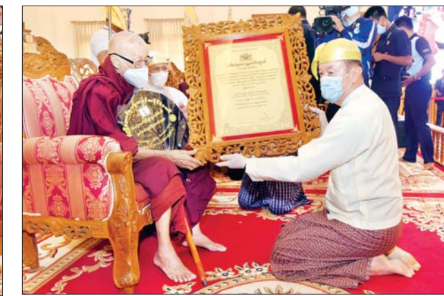
နိုင်ငံတော်စီမံအုပ်ချုပ်ရေးကောင်စီဝင် ဗိုလ်ချုပ်ကြီး မောင်မောင်ကျော် အဘိဓဇအဂ္ဂမဟာသဒ္ဓမ္မဇောတိက ဘွဲ့တံဆိပ်တော်ရ ဆရာတော် ဘဒ္ဒန္တသုမန အား ဘွဲ့တံဆိပ်ဆက်ကပ်စဉ်။