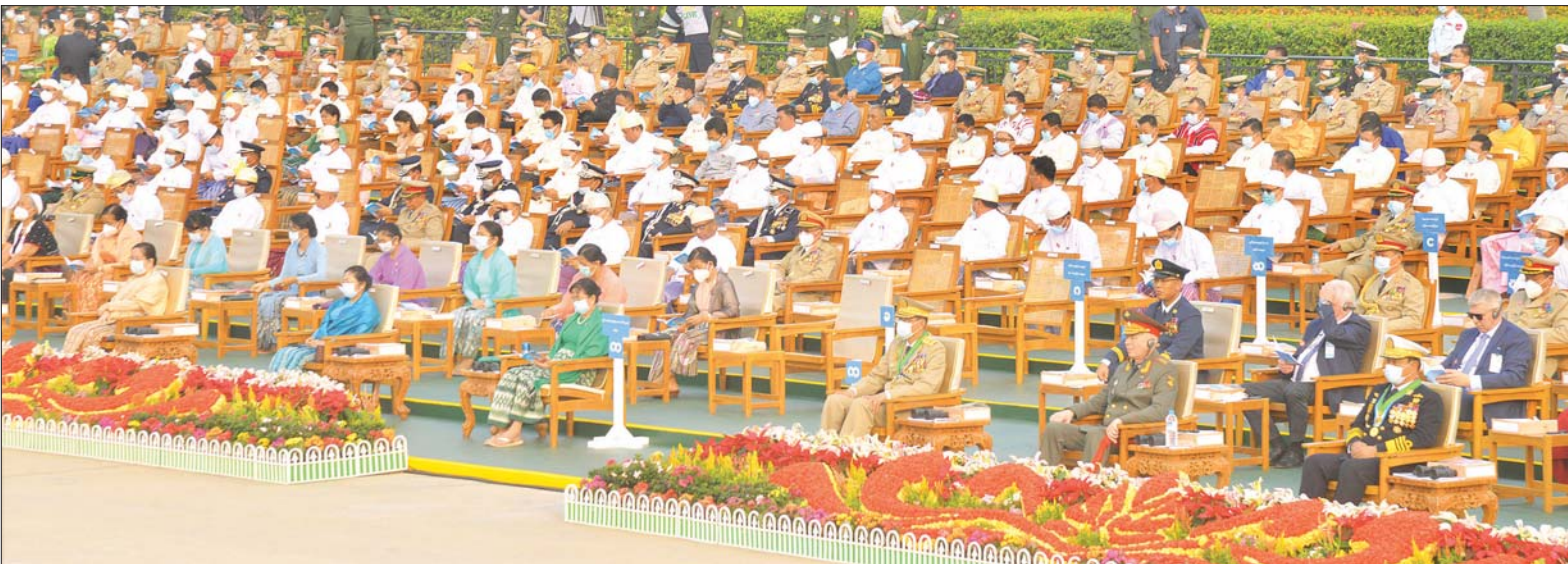
(၇၆) နှစ်မြောက် တပ်မတော်နေ့ စစ်ရေးပြအခမ်းအနားသို့ တက်ရောက်လာသည့် ရှားဖက်ဒရေရှင်းနိုင်ငံ ဒုတိယကာကွယ်ရေးဝန်ကြီး Colonel General Alexander Vasilyevich Fomin ဦးဆောင်သော ကိုယ်စားလှယ်အဖွဲ့ဝင်များနှင့် ဖိတ်ကြားထားသည့် ဧည့်သည်တော်များအား တွေ့ရစဉ်။

၁၉၈၉ ခုနှစ်အတွင်း၌ အရှေ့တောင်တိုင်းစစ်ဌာနချုပ် နယ်မြေ နယ်စပ်တစ်လျှောက်ရှိ သောင်းကျန်းသူ စခန်းများစွာကို တိုက်ခိုက် သိမ်းပိုက်နိုင်ခဲ့သည့် အပြင် ၁၉၉၁ ခုနှစ်တွင်လည်း မြစ်ဝကျွန်းပေါ်ဒေသကိုထိုးဖောက် ဝင်ရောက်လာသည့် သောင်းကျန်း သူများကိုလည်း အမြစ်ဖြတ် ချေမှုန်းနိုင်ခဲ့ကြောင်း၊ ၂၀၁၅ ခုနှစ်၊ ဖေဖော်ဝါရီလတွင် အရှေ့ မြောက်ပိုင်းနယ်စပ်ဒေသနယ်မြေ အတွင်း သောင်းကျန်းသူများသည် ကိုးကန့်ဒေသ တစ်ခုလုံးကို တိုက်ခိုက်သိမ်းပိုက်ထိန်းချုပ်ရန် နှင့် ထိုမှတစ်ဆင့် နယ်စပ်ဒေသ များဖြစ်သည့် မိုးကိုး-ဖောင်းဆိုင် ဒေသမှ မြန်မာပြည်မြောက်ပိုင်း နယ်မြေဘက်သို့ နယ်မြေချဲ့ထွင် နိုင်ရေးဆိုသည့် ရည်ရွယ်ချက်ဖြင့် လောက်ကိုင်တွင်ရှိသည့် ဌာနချုပ် အပါအဝင် လက်အောက်ခံ တပ်ရင်းများကို အင်အားအလုံး အရင်းဖြင့် ဝင်ရောက်တိုက်ခိုက် လာခဲ့ကြောင်း၊ ထို့ကြောင့် တပ်မတော်က မြို့တွင်းတိုက်ပွဲ