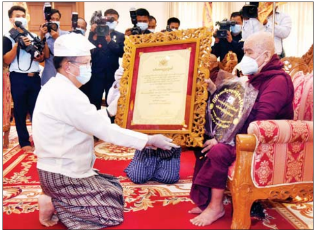
နိုင်ငံတော်စီမံအုပ်ချုပ်ရေးကောင်စီ အတွင်းရေးမှူး ဒုတိယ ဗိုလ်ချုပ်ကြီး အောင်လင်းဒွေး အဘိဓမ္မဟာရဋ္ဌဂုရု ဘွဲ့တံဆိပ်တော်ရ ဆရာတော် ဘဒ္ဒန္တဣန္ဒကထာဘိဝံသ အား ဘွဲ့တံဆိပ်ဆက်ကပ်စဉ်။