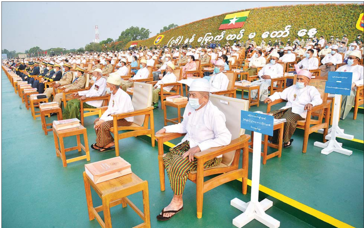
(၇၆) နှစ်မြောက် တပ်မတော်နေ့ စစ်ရေးပြအခမ်းအနားသို့ တက်ရောက်ကြသည့် ပြည်တွင်း၊ ပြည်ပမှ ဧည့်သည်တော်များနှင့် ဖိတ်ကြား ထားသူများအား တွေ့ရစဉ်။

တပ်မတော်အနေဖြင့် ထို ကဲ့သို့ ပြည်သူလူထုကာကွယ် စောင့်ရှောက်ရေး လုပ်ငန်းများ တွင် စိတ်ရင်းစေတနာမှန်ကန် စွာဖြင့် ကူညီဆောင်ရွက်ပေး လျက်ရှိသကဲ့သို့ ဒီမိုကရေစီနှင့်