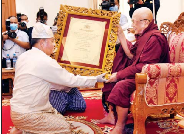
နိုင်ငံတော်စီမံအုပ်ချုပ်ရေးကောင်စီ တွဲဖက်အတွင်းရေးမှူး ဒုတိယဗိုလ်ချုပ်ကြီး ရဲဝင်းဦး အဘိဓမ္မဟာရဋ္ဌဂုရု ဘွဲ့တံဆိပ်တော်ရ ဆရာတော် ဒေါက်တာ ဘဒ္ဒန္တဝေဠုရိယ အား ဘွဲ့တံဆိပ်ဆက်ကပ်စဉ်။