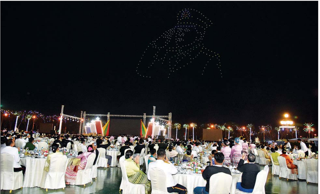
(၇၆)နှစ်မြောက် တပ်မတော်နေ့ အထိမ်းအမှတ်ညွှန်ပွဲနှင့် ဂုဏ်ပြုညစာစားပွဲအခမ်းအနား တက်ရောက်လာကြသူများကို တွေ့ရစဉ်။