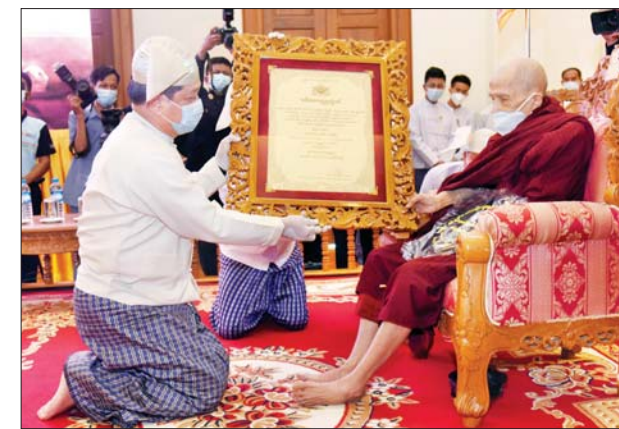
နိုင်ငံတော်စီမံအုပ်ချုပ်ရေးကောင်စီဝင် ဗိုလ်ချုပ်ကြီး တင်အောင်စန်း အဘိဓဇမဟာရဋ္ဌဂုရု ဘွဲ့တံဆိပ်တော်ရ ဆရာတော် ဘဒ္ဒန္တဝိမလာ ဘိဝံသ အား ဘွဲ့တံဆိပ်ဆက်ကပ်စဉ်။