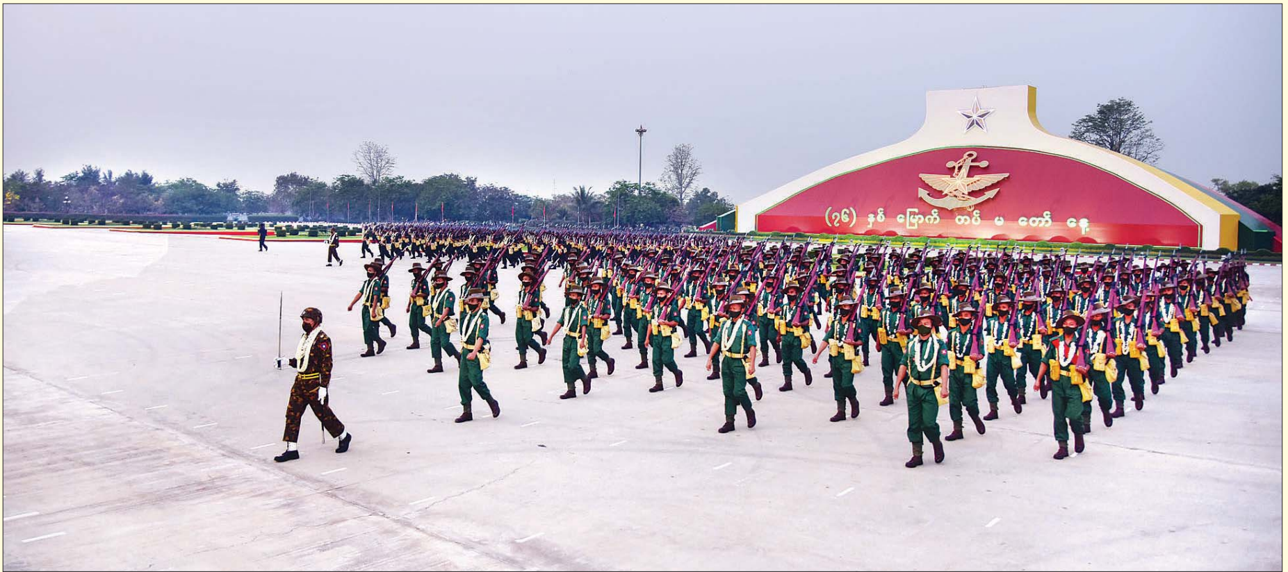
(၇၆) နှစ်မြောက် တပ်မတော်နေ့ စစ်ရေးပြအခမ်းအနား၌ နိုင်ငံတော်စီမံအုပ်ချုပ်ရေးကောင်စီဥက္ကဋ္ဌ၊ တပ်မတော်ကာကွယ်ရေးဦးစီးချုပ် ဗိုလ်ချုပ်မှူးကြီး မဟာသရေစည်သူ မင်းအောင်လှိုင်အား စစ်ရေးပြ စစ်ကြောင်းကြီးများက ချီတက်အလေးပြုကြစဉ်။