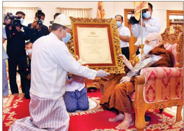
နယ်စပ်ရေးရာဝန်ကြီးဌာန ပြည်ထောင်စုဝန်ကြီး ဒုတိယဗိုလ်ချုပ်ကြီး ထွန်းထွန်းနောင် အဘိဓမ္မမဟာရဋ္ဌဂုရု ဘွဲ့တံဆိပ်တော်ရ ဆရာတော် ဘဒ္ဒန္တဂန္ဓမာလာဘိဝံသ အား ဘွဲ့တံဆိပ်ဆက်ကပ်စဉ်။