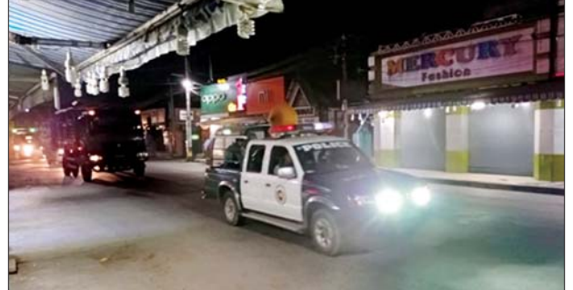
သတင်းစဉ်

နိုင်ငံတော်တည်ငြိမ်အေးချမ်းရေးနှင့် အများပြည်သူတို့၏ လုံခြုံရေး၊ တရားဥပဒေစိုးမိုးရေးနှင့် ရပ်ရွာအေးချမ်းသာယာရေးတို့ အတွက် တပ်မတော်၊ မြန်မာနိုင်ငံရဲတပ်ဖွဲ့၊ မြန်မာနိုင်ငံ မီးသတ်တပ်ဖွဲ့တို့ တပ်ဖွဲ့ဝင်များဖြင့် ပူးပေါင်း၍ ဖေဖော်ဝါရီ ၁၄ ရက် ညပိုင်းမှစတင်၍ လုံခြုံရေးကို နေ့ညမပြတ် ပြည့်ဝစွာဆောင်ရွက်ပေးလျက်ရှိရာ ယနေ့တွင်လည်း မိဘပြည်သူများအနေဖြင့် စိတ်အေးချမ်းသာယာစွာ နေထိုင်နိုင်စေရေး၊ ရပ်ရွာအေးချမ်း သာယာမှုရှိစေရေးအတွက် တိုင်းဒေသကြီးနှင့် ပြည်နယ်အသီးသီးရှိမြို့နယ်များ၌ လှည့်ကင်း၊ ပတ်ကင်းများဖြင့် လိုအပ်သည့် လုံခြုံရေးလုပ်ငန်းများကို ဆက်လက် ဆောင်ရွက်ပေးလျက်ရှိကြောင်းနှင့် လုံခြုံရေးတပ်ဖွဲ့ဝင်များက နေ့ညမပြတ် လုံခြုံရေးတာဝန်များကို ဆက်လက်ထမ်းဆောင်ပေး သွားမည်ဖြစ်ကြောင်း သတင်းရရှိသည်။