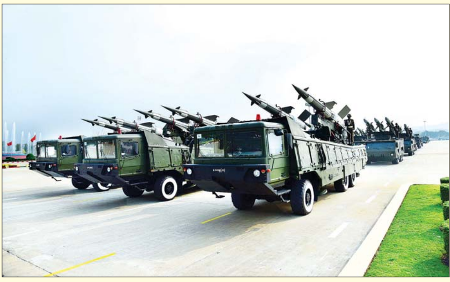
(၇၆) နှစ်မြောက် တပ်မတော်နေ့ စစ်ရေးပြအခမ်းအနား၌ နိုင်ငံတော်စီမံအုပ်ချုပ်ရေးကောင်စီဥက္ကဋ္ဌ တပ်မတော်ကာကွယ်ရေးဦးစီးချုပ် ဗိုလ်ချုပ်မှူးကြီး မဟာသရေစည်သူ မင်းအောင်လှိုင်အား ယန္တရားစစ်ကြောင်းက ချီတက်အလေးပြုစဉ်။