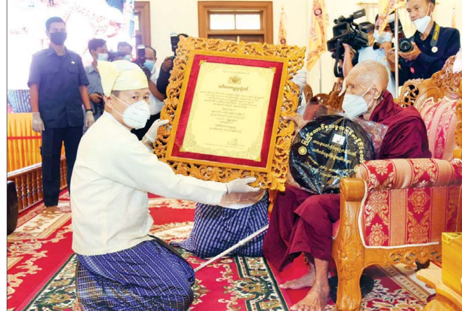
နိုင်ငံတော်စီမံအုပ်ချုပ်ရေးကောင်စီ ဒုတိယဥက္ကဋ္ဌ၊ ဒုတိယတပ်မတော်ကာကွယ်ရေးဦးစီးချုပ် ကာကွယ်ရေးဦးစီးချုပ် (ကြည်း) ဒုတိယဗိုလ်ချုပ်မှူးကြီး စိုးဝင်း အဘိဓဇမဟာရဋ္ဌဂုရု ဘွဲ့တံဆိပ်တော်ရ ဆရာတော် ဘဒ္ဒန္တဣန္ဒက အား ဘွဲ့တံဆိပ်ဆက်ကပ်စဉ်။