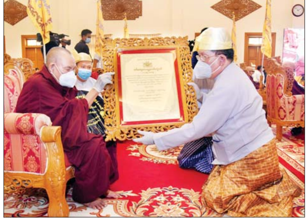
ပြည်ထောင်စုတရားသူကြီးချုပ် ဦးထွန်းထွန်းဦး အဘိဓမ္မ အဂ္ဂမဟာသဒ္ဓမ္မဇောတိက ဘွဲ့တံဆိပ်တော်ရ ဆရာတော် ဘဒ္ဒန္တ သုန္ဒရ အား ဘွဲ့တံဆိပ်ဆက်ကပ်စဉ်။