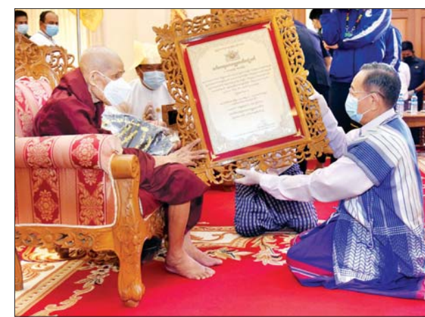
နိုင်ငံတော်စီမံအုပ်ချုပ်ရေးကောင်စီဝင် မန်းငြိမ်းမောင် အဘိဓဇ အဂ္ဂမဟာသဒ္ဓမ္မဇောတိက ဘွဲ့တံဆိပ်တော်ရ ဆရာတော် ဘဒ္ဒန္တ စန္ဒာဝရ အား ဘွဲ့တံဆိပ်ဆက်ကပ်စဉ်။