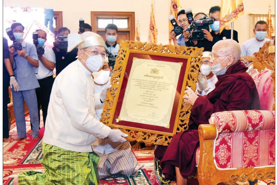
နိုင်ငံတော်စီမံအုပ်ချုပ်ရေးကောင်စီဥက္ကဋ္ဌ၊ တပ်မတော်ကာကွယ်ရေးဦးစီးချုပ် ဗိုလ်ချုပ်မှူးကြီး မင်းအောင်လှိုင် အဘိဓဇမဟာရဋ္ဌဂုရု ဘွဲ့တံဆိပ်တော်ရ ဆရာတော် ဘဒ္ဒန္တဂန္ဓမာ အား ဘွဲ့တံဆိပ် ဆက်ကပ်စဉ်။

မဟာနာယကအဖွဲ့ဥက္ကဋ္ဌ ဗန်းမော် ဆရာတော်ဘုရားကြီးထံမှ နိုင်ငံ တော် စီမံအုပ်ချုပ်ရေးကောင်စီ ဥက္ကဋ္ဌ တပ်မတော်ကာကွယ်ရေး ဦးစီးချုပ်နှင့် ဇနီးနှင့် ဧည့်ပရိသတ် တို့က ငါးပါးသီလ ခံယူ ဆောက်တည်ကြသည်။ ယင်းနောက် အဘိဓဇမဟာ ရဋ္ဌဂုရု ဘွဲ့တံဆိပ်တော် ဆက်ကပ် ခံယူတော်မူမည့် ပဲခူးတိုင်းဒေသ သူများ တက်ရောက်ကြသည်။ အခမ်းအနားကို နမောတဿ သုံးကြိမ်ရွတ်ဆို ဘုရားကန်တော့ ဂန္ဓမာ မဟာထေရ်မြတ်က စာမျက်နှာ ၄ သို့