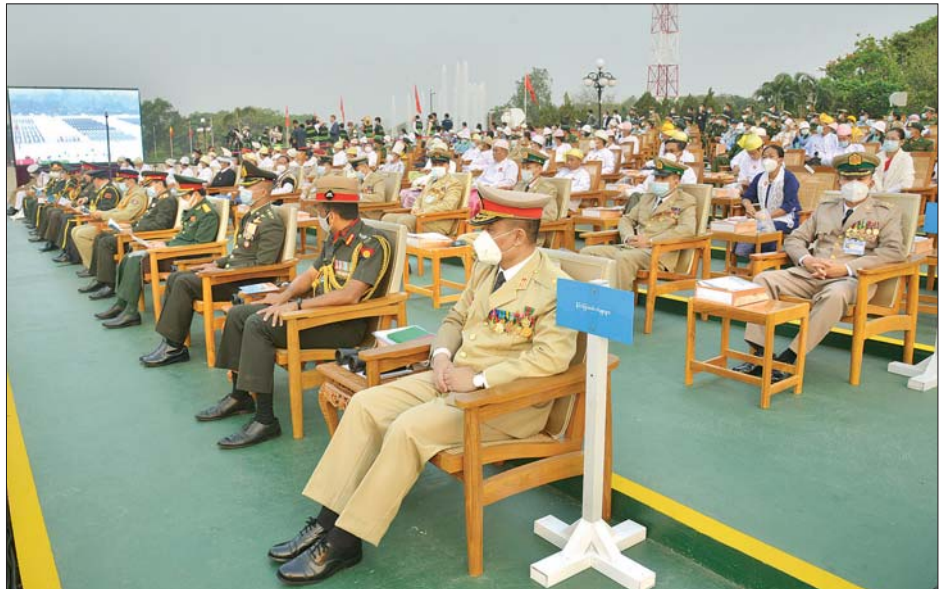
(၇၆) နှစ်မြောက် တပ်မတော်နေ့ စစ်ရေးပြအခမ်းအနားသို့ တက်ရောက်ကြသည့် နိုင်ငံခြားစစ်သံရုံးများမှ စစ်သံမှူးများနှင့် ဖိတ်ကြားထားသူများအား တွေ့ရစဉ်။

မှုများကို နှိမ်နင်းခြင်းသာမက ၁၉၅၀-၆၀ ခုနှစ်ကာလအတွင်း တွင် ပြည်ပကျူးကျော်သူ ကူမင်တန် (တရုတ်ပြု) များ၊ ရခိုင်ပြည်နယ်အတွင်းတွင် အခြေပြု လှုပ်ရှားနေတဲ့ ကုလားဆိုး သောင်းကျန်းသူများကို တိုက်ခိုက်နှိမ်နင်းနိုင်ခဲ့ကြောင်း၊ ၁၉၆၂-၇၂ ခုနှစ်တွင် ပဲခူးတိုင်းနှင့် ဧရာဝတီတိုင်းတို့တွင် သောင်းကျန်းသူ စာမျက်နှာ ၈ သို့