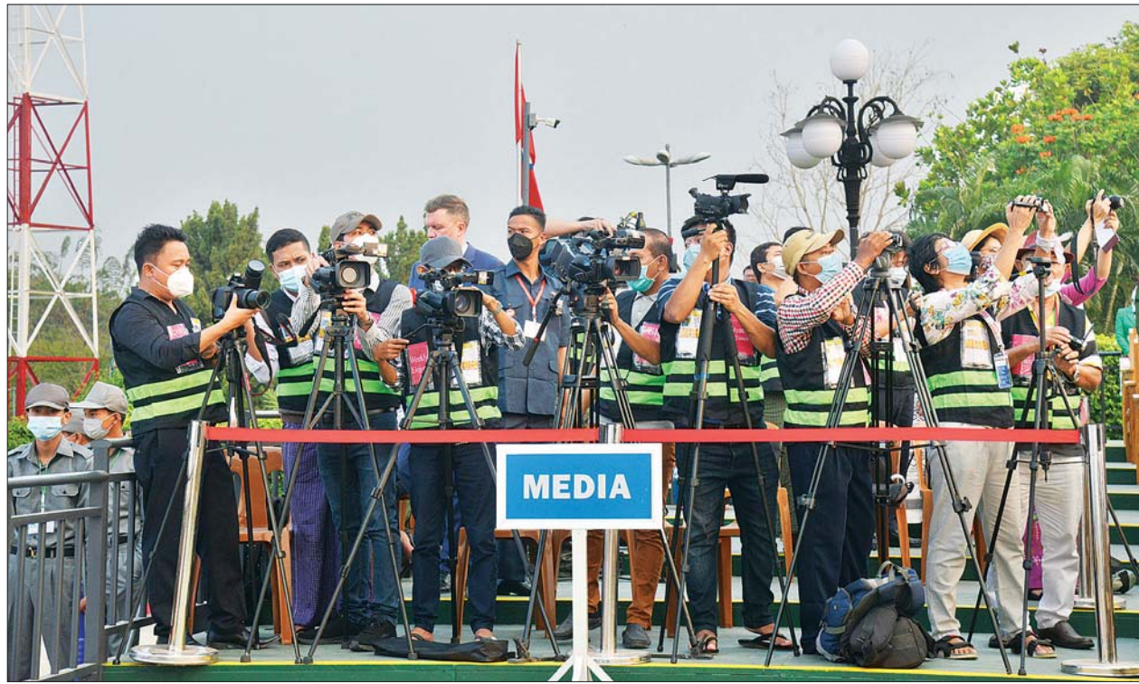
(၇၆) နှစ်မြောက် တပ်မတော်နေ့စစ်ရေးပြအခမ်းအနားသို့ တက်ရောက်သတင်းရယူကြသည့် ပြည်တွင်း၊ ပြည်ပ သတင်းမီဒီယာသမား များအား တွေ့ရစဉ်။

ဥပဒေပြုလုပ်ငန်းကို လုပ် ဆောင်ကြမည့် လွှတ်တော် ကိုယ်စားလှယ်များသည် ဥပဒေ ကို စံပြုလိုက်နာရန်လိုကြောင်း၊ ၎င်းတို့ကိုယ်တိုင်က ဥပဒေကို လေးစားလိုက်နာမှုမရှိ ချိုးဖောက် မှုပြုနေကြပါက မိမိတို့မျှော်မှန်း ထားသည့် ဒီမိုကရေစီသည် စည်းကမ်းမရှိသည့် ဒီမိုကရေစီ သာ ဖြစ်လိမ့်မည်ဖြစ်ကြောင်း၊ ယခုလည်း ပါတီခေါင်းဆောင် အချို့သည် အဂတိလိုက်စားမှုများ စစ်ဆေးတွေ့ရှိရသဖြင့် ဥပဒေနှင့် အညီ အရေးယူဆောင်ရွက်နေ ကြောင်း။