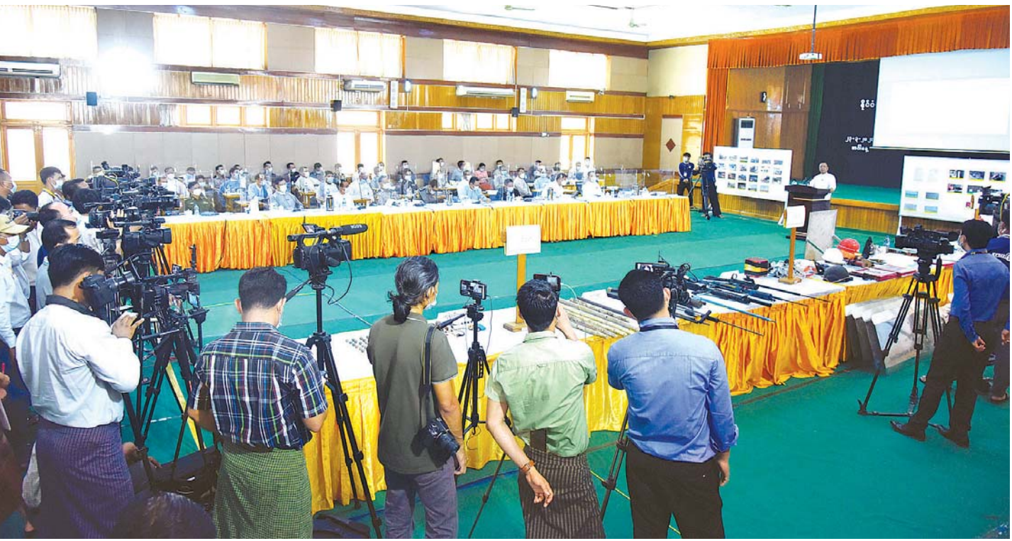
နိုင်ငံတော် စီမံအုပ်ချုပ်ရေးကောင်စီ၊ သတင်းထုတ်ပြန်ရေးအဖွဲ့ခေါင်းဆောင် ဗိုလ်မှူးချုပ်ဇော်မင်းထွန်း သတင်းမီဒီယာများ၏ သိရှိလိုသည့် မေးမြန်းမှုများကို ပြန်လည်ဖြေကြားစဉ်။

ဗိုလ်မှူးချုပ် ဇော်မင်းထွန်းက သတင်းမီဒီယာသမားများကို အာမခံချက်အပေးနိုင်ဆုံးလူသည် သတင်းမီဒီယာသမားများ ကိုယ်တိုင်ပင်ဖြစ်ကြောင်း၊ သတင်းမီဒီယာသမားများကို အာမခံချက်အပေး