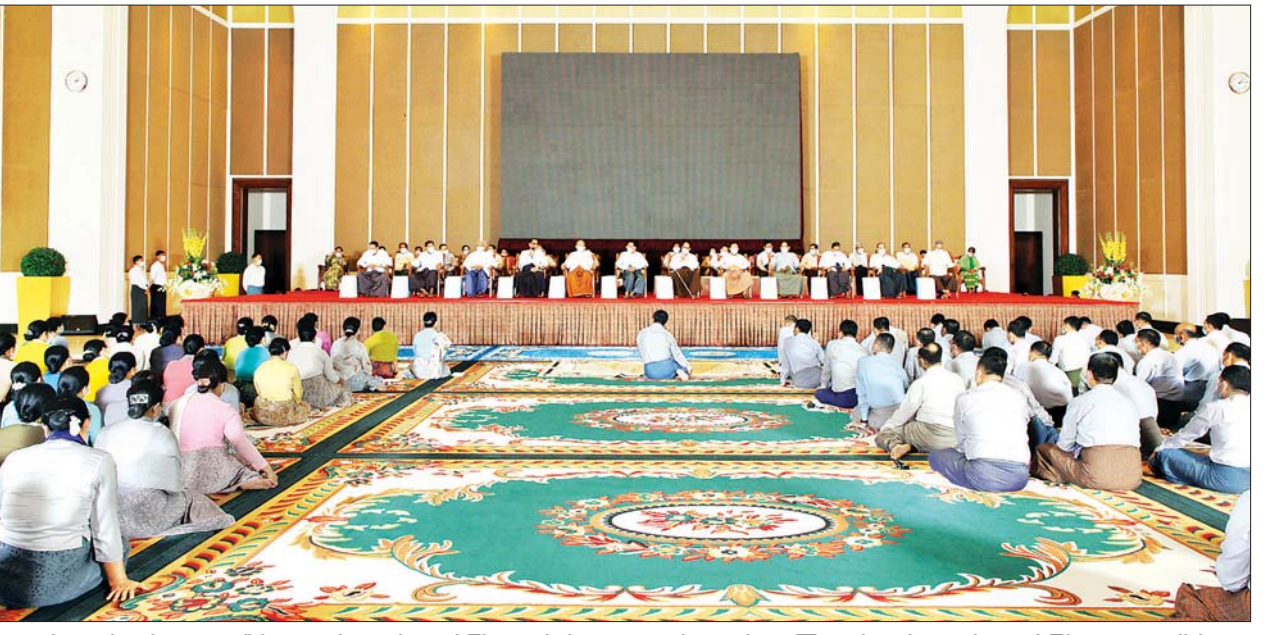
ထို့နောက် ကန်တော့ခံအငြိမ်းစား တပ်မတော်အရာရှိကြီးများကိုယ်စား ဗိုလ်ချုပ်သူရစောဖြူ (အငြိမ်းစား) နှင့် ဒုတိယဗိုလ်ချုပ်ကြီး ထွန်းကြည် (အငြိမ်းစား)တို့က ဩဝါဒစကားများ ပြန်လည်ပြောကြားကြသည်။ ယင်းနောက် ညှိနှိုင်းကွပ်ကဲရေးမှူး (ကြည်း၊ ရေ၊ လေ) နှင့် တက်ရောက်လာကြသည့် တပ်မတော်အရာရှိကြီးများက အငြိမ်းစား တပ်မတော်အရာရှိကြီးများထံ ဂါရဝပြု လက်ဆောင်ပစ္စည်းများကို ကိုယ်တိုင်ကိုယ်ကျ ရိုသေစွာဂါရဝပြုပေးအပ်ကြကြောင်း သတင်းရရှိသည်။ သတင်းစဉ်

နေပြည်တော် မတ် ၂၇ ယနေ့တွင် ကျရောက်သည့် (၇၆)နှစ်မြောက် တပ်မတော်နေ့ စစ်ရေးပြ အခမ်းအနားသို့ တက်ရောက်ကြသည့် တပ်မတော်တွင် တာဝန်ထမ်းဆောင်ခဲ့သည့် အငြိမ်းစားတပ်မတော် အရာရှိကြီးများအား တပ်မတော်(ကြည်း၊ ရေ၊ လေ) မိသားစုများက ဂါရဝပြုကန်တော့သည့် အခမ်းအနားကို ယနေ့မွန်းလွဲပိုင်းတွင် နေပြည်တော်ရှိ ဇေယျာသီရိဗိမာန် ဧည့်ခန်းမဆောင်၌ ကျင်းပပြုလုပ်သည်။ (ယာပုံ) အဆိုပါ ဂါရဝပြုကန်တော့သည့် အခမ်းအနားသို့ အငြိမ်းစားတပ်မတော်အရာရှိကြီးများနှင့်ဇနီးများက ကန်တော့ခံတက်ရောက်ကြပြီး ညှိနှိုင်းကွပ်ကဲရေးမှူး (ကြည်း၊ ရေ၊ လေ) ဗိုလ်ချုပ်ကြီး မောင်မောင်အေးနှင့်ဇနီး ဦးဆောင်၍ ကာကွယ်ရေးဦးစီးချုပ်ရုံး (ကြည်း၊ ရေ၊ လေ)မှ တပ်မတော်အရာရှိကြီးများနှင့်ဇနီးများ တက်ရောက် ဂါရဝပြုကန်တော့ကြသည်။ အခမ်းအနားတွင် နိုင်ငံတော်စီမံအုပ်ချုပ်ရေးကောင်စီဥက္ကဋ္ဌ တပ်မတော်ကာကွယ်ရေးဦးစီးချုပ် ဗိုလ်ချုပ်မှူးကြီး မင်းအောင်လှိုင် ကိုယ်စား ညှိနှိုင်းကွပ်ကဲရေးမှူး (ကြည်း၊ ရေ၊ လေ) ဗိုလ်ချုပ်ကြီး မောင်မောင်အေး က ဂါရဝပြုစကားပြောကြားသည်။ ယင်းနောက် တက်ရောက်လာကြသူများက တပ်မတော်(ကြည်း၊ ရေ၊ လေ) မိသားစုများကိုယ်စား အငြိမ်းစားတပ်မတော်အရာရှိကြီးများအား မြန်မာ့ရိုးရာ ထုံးတမ်းအစဉ်အလာနှင့်အညီ ရိုသေစွာဖြင့် ဂါရဝပြုကန်တော့ကြသည်။