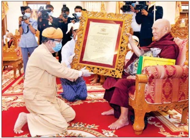
နိုင်ငံတော်စီမံအုပ်ချုပ်ရေးကောင်စီဝင် ဦးစိုင်းလုံးဆိုင် အဘိဓမ္မ မဟာရဋ္ဌဂုရု ဘွဲ့တံဆိပ်တော်ရ ဆရာတော် ဘဒ္ဒန္တသုဇနာဘိဝံသ အား ဘွဲ့တံဆိပ်ဆက်ကပ်စဉ်။